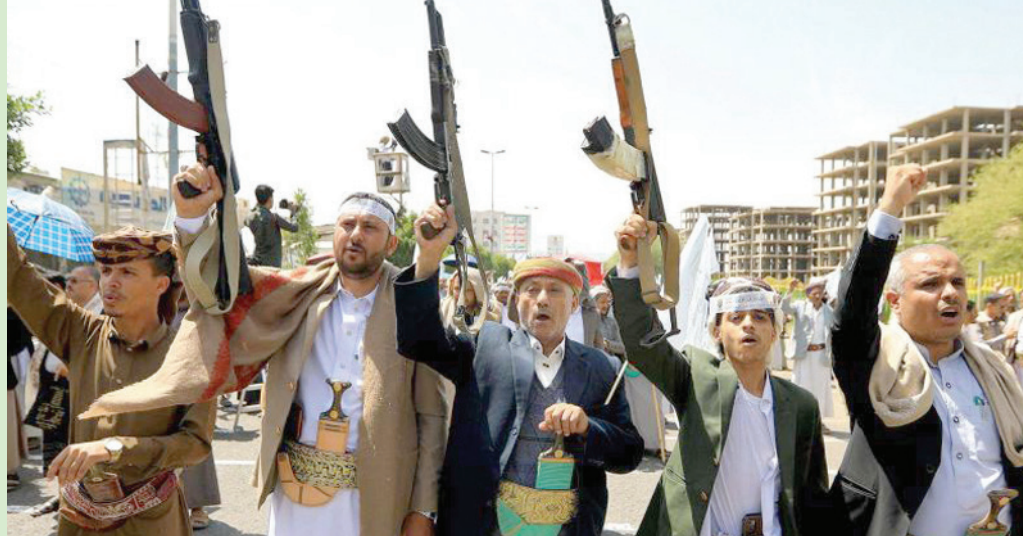
مظاهرات حوثية في صنعاء خلال يونيو الماضي تهديد المجتمع الدولي

تسيطر حالة من القلق في الأوساط الحقوقية والإنسانية على اليمن بعد قرار الجماعة الحوثية بإغلاق المفوضية السامية لحقوق الإنسان في صنعاء، بينما تفيد مصادر مطلعة باستعداد منظمات دولية لإغلاق مكاتبها رفضاً للهيمنة والإجراءات التعسفية بعد أسابيع من اختطاف موظفي المنظمات والسفارات، واتهامهم بالتجسس والخيانة في ظل صمت أممي. وذكرت مصادر حقوقية في العاصمة صنعاء أن الجماعة الحوثية خاطبت، الأسبوع الماضي، المفوضية الأممية بإغلاق مقرها في صنعاء في غضون ثلاثة أيام، دون إبداء الأسباب التي دفعتها لاتخاذ مثل هذا القرار، بينما لم يصدر عن الأمم المتحدة أي تعليق حول ذلك.