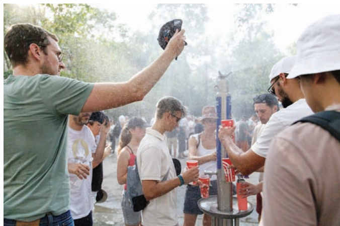
أشخاص أمام نافورة مياه ورشاش للتبريد في باريس التي تعاني من موجة حارة

ذوبان الجليد والثلوج في الجبال، وفي سهل وسط أوروبا. وأضاف يونتييمو أن موجات الحر في أوروبا صارت أكثر تكراراً وقوة، وأن ذلك سوف يستمر لفترة أطول من ذي قبل، مضيفاً: «هذا أمر يجب أن نعتاد عليه». وتؤثر هذه الظواهر على الاقتصاد الكلي للدول، نظراً لتأثير قطاعات صناعية وتجارية وغذائية بشكل مباشر بارتفاع درجات الحرارة، إذ تمثل موجات ارتفاع الحرارة، واشتعال الحرائق نتيجة زيادة معدل الظواهر الجوية الحادة في أوروبا، خطورة على السكان في أنحاء القارة، وعلى سبل معيشتهم، وعلى الحيوانات والمحاصيل الزراعية، مما يخلف خسائر تقدر بملايين اليوروات. وفي نهاية يوليو، كان جميع مناطق إسبانيا، عدا جزر الكناري، في حالة «تأهب باللون البرتقالي»، مع تحذيرات من أن درجات الحرارة القصوى سوف تصل إلى 39 - 40 درجة مئوية، بحسب ما ذكرته وكالة الأرصاد الجوية الإسبانية «إيميت». وفي الوقت نفسه، أدت موجة الحر إلى ارتفاع معدلات الحرارة في جنوب