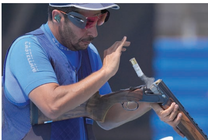
العرب خرجوا بشكل جماعي في منافسات الرماية

الدومينيكان: «الامر برمته يشع ضوءاً نوعاً ما. ربما يكون أمراً انتوياً أن أفكر أنه جميل، لكنني أعتقد ذلك، مضمراً أرجواني، يا للروعة».