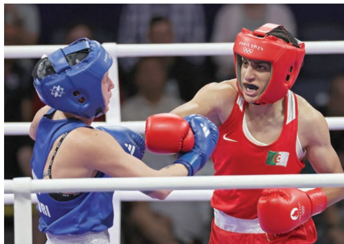
البطلة الجزائرية تضمنت ميدالية لبلادها في الألعاب الأولمبية

وإن باخ ردود الفعل على وسائل التواصل الاجتماعي تجاه خليف ولين، الأولمبية في لوس أنجلوس إلا إذا كان لدينا شريك موثوق به».