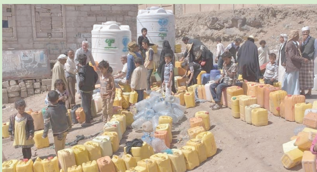
واحد من كل شخصين في اليمن لا يحصل على المياه النظيفة (الأمم المتحدة)

وبين التقرير أن من أسباب تفاقم الأمن الغذائي خلال الفترة من مايو (أيار) وحتى يوليو (تموز) ما يعرف بموسم العجاف في