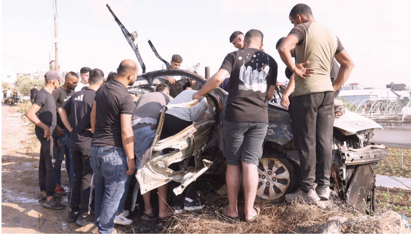
فلسطينيون يتفقدون سيارة استهدفتها أسرة غزة إسرائيلية على طولكرم في الضفة الغربية

إنه منذ السابع من أكتوبر نُقل آلاف الفلسطينيين، من بينهم مسعفون ومرضى ومقاتلون أسرى، من غزة إلى إسرائيل «مقيدون عادة ومعصوبي الأعين»، بينما تم اعتقال آلاف آخرين في الضفة الغربية وإسرائيل. وبحسب نادي الأسير الفلسطيني، يتجاوز عدد المعتقلين في السجون الإسرائيلية حالياً عتبة 9700 شخص، بينهم المئات من المعتقلين الإداريين. ووفق تقديرات الجمعية، تضاعف عدد الاعتقالات التي تنفذها إسرائيل منذ السابع من أكتوبر، مقارنة مع الفترة ذاتها من العام السابق. وأكد مكتب المفوض السامي في تقريره أن المعتقلين «احتجزوا في الغالب في معتقلات سرية دون إعطائهم أسباباً لاحتجازهم أو السماح لهم بالاتصال بمحام أو بمراجعة قضائية فاعلة». ولم تعلق إسرائيل على الفور على التقرير، لكنها رفضت تقارير سابقة أفادت بأن سجونها تطبق فيها القانون الدولي. وصدر التقرير الأممي غداة استجواب الشرطة العسكرية الإسرائيلية لجنود تم اعتقالهم للاشبهاء في اعتدائهم جنسياً على معتقل فلسطيني.