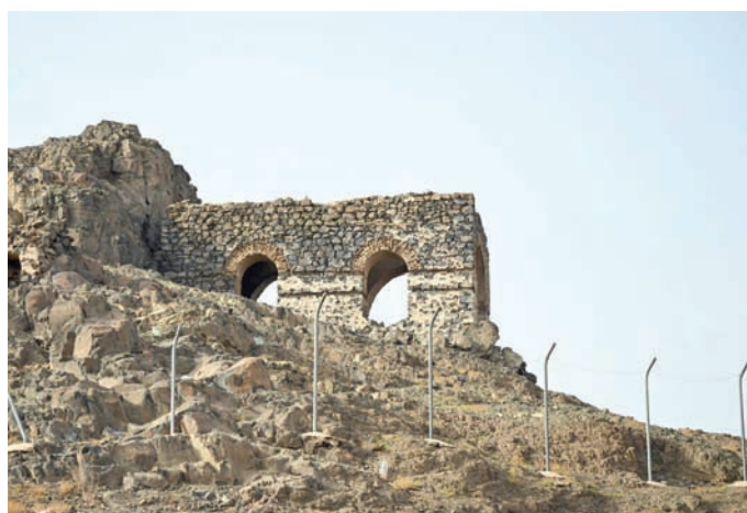
عشرات المواقع بقيت محتفظة بعبق تاريخ المكان

حكي الوقيصي عن بعض الآثار التي تعرضت للتشويه والإغلاق، مثل مسجد الفتحة الذي سُدت أبوابه بالحواجز الإسمنتية، وبعض المواقع الأثرية التي كادت تُهدم لولا تدخل الجهات المسؤولة في اللحظات الأخيرة، وأضاف: «بعض الآثار المهمة سُويت بالأرض؛ لأسباب غير مبررة، وقد استدرتتها الجهات المسؤولة مؤخراً، وإلا كانت ستُحمى تماماً، ونفقد كل