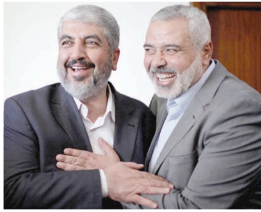
خالد مشعل يعانق إسماعيل هنية قبل مغادرته قطاع غزة

لكن رغم ذلك في نهاية المطاف، قررت الأجهزة الأمنية الاستجابة للطلب الأميركي وإرسال وفد على مستوى عال، لإرسال رسالة مفادها أن إسرائيل جادة في المفاوضات. وخلال المحادثة الصعبة التي أجراها الرئيس الأميركي مع نتنهاو، أبلغ رئيس الوزراء أن وفداً إسرائيلياً سيبضع إلى المحادثات مساء الأحد أو السبت، وقد تم تقديم موعد إرسال الوفد بسبب الضغوط وإرسال رسائل لطماننة واشنطن.