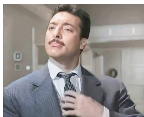
الفنان المصري رشدي أباطة جسد أدواراً متنوعة خلال مشواره الفني

وتوضح منيرة أن سبب رفض رشدي لتقديم مسلسلات طيلة مشواره يرجع لعدم حبه للتلفزيون بل كان عاشقاً للسينما، حتى أن المسلسل الوحيد في حياته (الصفقة) لم ير النور بسبب مرضه ووفاته.