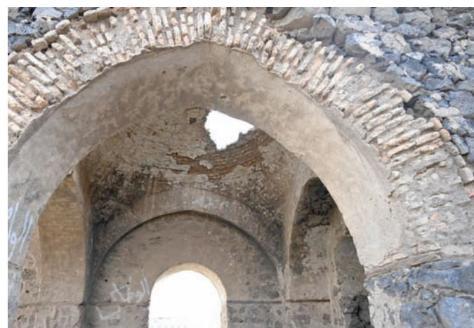
خطة لتأهيل عشرات المواقع التاريخية في مكة المكرمة والمدينة المنورة (واس)

الفترة الحالية، فإن مناطق السعودية لا تزال مليئة بالكنوز التراثية والمناجم الأثرية. واستشهد الوقيصي بمسجد