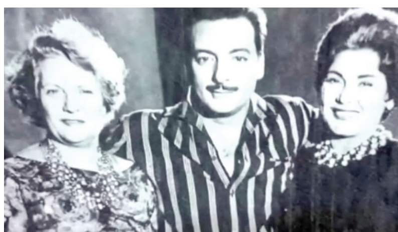
رشدي أباطة يتوسط والدته الإيطالية والفنانة تحية كاريوكا

وقال الناقد والمؤرخ الفني المصري محمد شوقي: «رشدي أباطة كان لديه جانب إنساني لا يذكره الكثيرون، فقد كان نصير الفنين والعمال»، وكشف