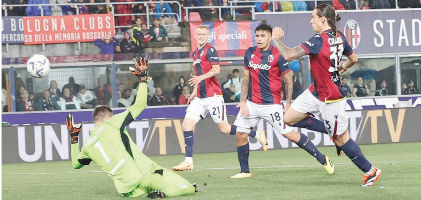
كالا فيوري يهز شبك يوفنتوس في الدوري الإيطالي قبل الرحيل عن بولونيا (إ.ب.أ)

في الواقع، تُعد التغييرات التي أُجريت في مركز حراسة المرمى دليلاً آخر على أولويات أرتيتا. ومع ذلك، لم يتم التعاقد مع كالا فيوري على أنه مدافع فقط، ولكن على أنه إضافة قوية أيضاً لترسانة أرتيتا الهجومية بفضل قدرته على الاستحواذ على الكرة وتمرير كرات بينية متقنة والتقدم من الخلف للأمام لإحداث حالة من الارتباك في صفوف المنافسين.