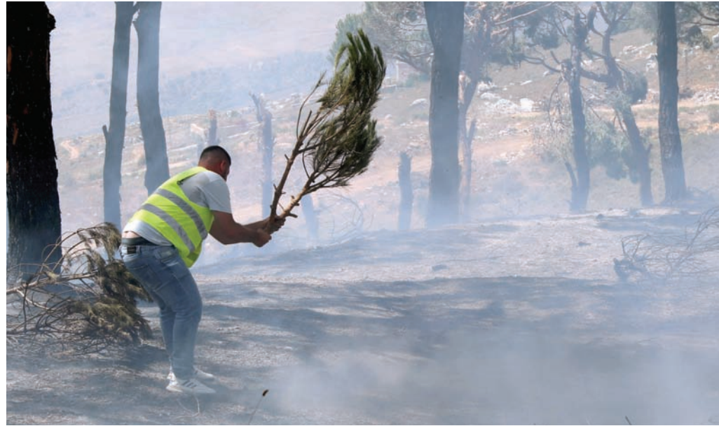
لبناني يحاول إخماد نيران اندلعت في مرجعيين جراء غارة إسرائيلية

وقال الحزب في بيان: «شنت المقاومة الإسلامية هجوماً مشتركاً بالصواريخ والمسيرات، إذ استهدفت بصواريخ (الكاتيوشا) والفلق) 6 تكعات ومواقع عسكرية». وأضاف: «بالنظر، شنّ مجاهدو القوة الجوية بعدة أسراب من المسيّرات الانقضاضية هجوماً جويًا» على 3 قواعد أخرى، بينها قاعدة قال إنها تضم مقرّاً استخباراتياً «مسيوولاً عن الاغتيالات». ووضعت الحزب الهجوم في «إطار الرد على الاغتيال الذي نفذته العدو الصهيوني في بلدة