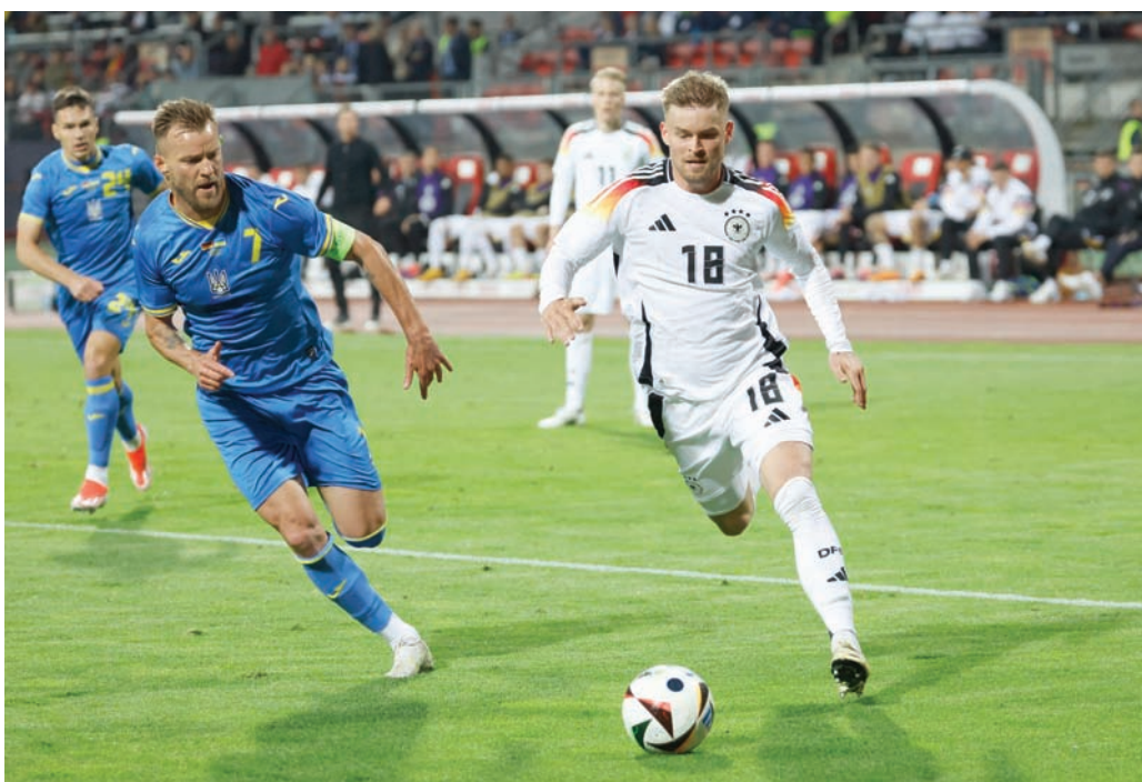
ميتلشتات أصبح الآن ركيزة أساسية في صفوف المنتخب الألماني

كان يُنظر إلى ميتلشتات على أنه لاعب واعد في هيرتا برلين، لكنه لم يصل مع الفريق إلى ربع إمكاناته في حقيقة الأمر. وبعد هيرتا برلين، انتقل ميتلشتات إلى شتوتغارت الصيف الماضي مقابل 500 ألف يورو. كانت التوقعات منخفضة للغاية بشأن هذا اللاعب، لكنه تألق بشدة وقاد الفريق لاحتلال المركز الثاني متقدماً على بايرن ميونيخ. لقد ساعد المدير الفني سيباستيان هونيس، ميتلشتات على تقديم أفضل ما لديه داخل الملعب، وهو الأمر الذي صب في مصلحة المنتخب الألماني أيضاً. لقد كان ميتلشتات رائعاً في أول مباراة دولية له ضد فرنسا في مارس (آذار) الماضي، وسجل هدفاً في مرعى هولندا في مباراته الثانية، وأصبح الآن ركيزة أساسية في صفوف