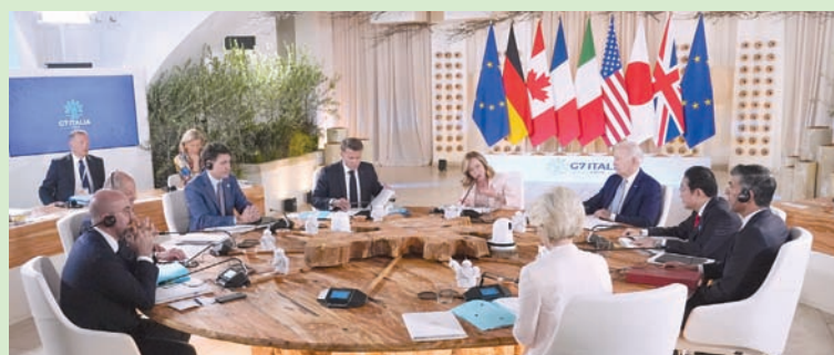
قادة «مجموعة السبع» ورئيسا المجلس الأوروبي والمفوضية الأوروبية مجتمعون في بورغو إيفنازيا بإيطاليا أمس

في سياق متصل، أكد مسؤول كبير في حلف شمال الأطلسي (الاناتو)، أمس، أن الدول الأعضاء «تخطت بيس» هدف وضع 300 ألف جندي في حال تآهب قصوى، فيما يواجه الحلف تهديداً من روسيا. (تفاصيل ص 11)