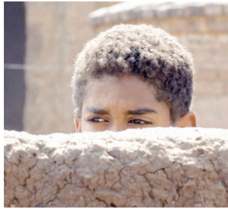
«ستموت في العشرين» (أندولفي بروكشنز)