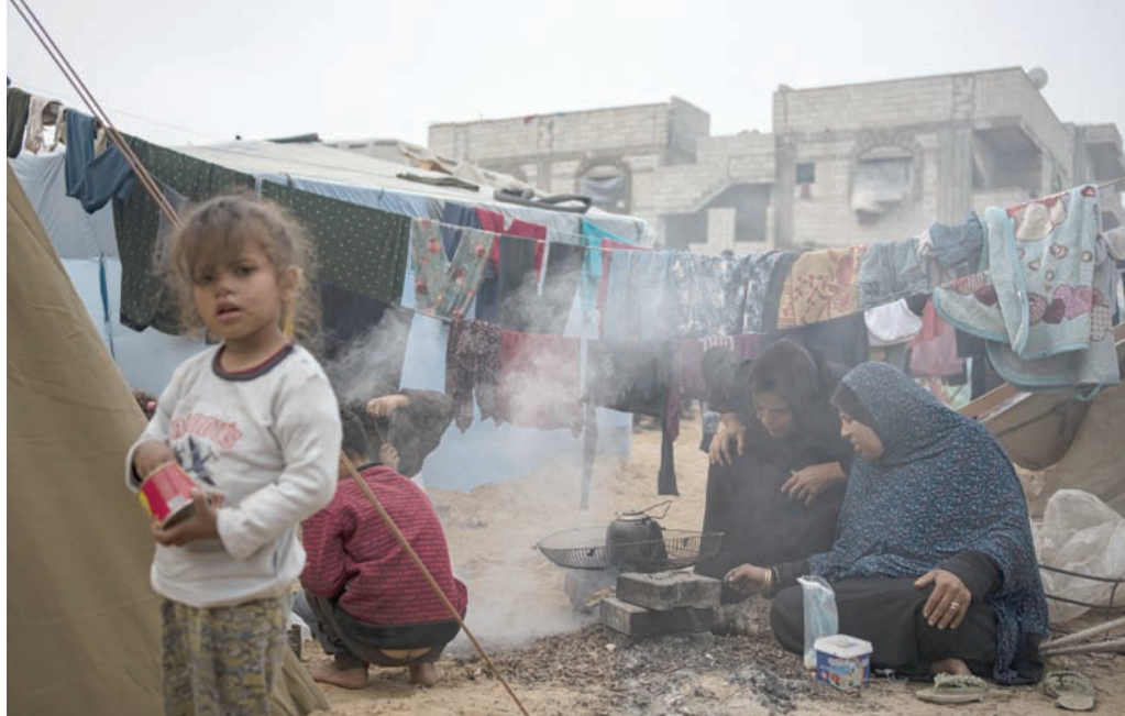
نازحون في مخيم «الخيام» المؤقت في منطقة المواصي شمال غربي مدينة رفح

وذلك رداً على توعد من رئيس الوزراء الإسرائيلي، بنيامين نتنياهو بتفكيك قدراتها. بينما تمسك قطر ومصر في أكثر من مناسبة، بـ«ضرورة تولى سلطة فلسطينية حكم غزة والضفة الغربية». أستاذ العلاقات الدولية في