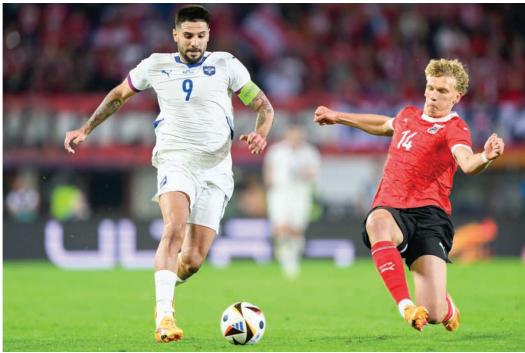
ميتروفيتش خلال مباراة صربيا والنمسا الودية

مقاعدهم في منتخباتهم، بعدما عاد نجولو كاتي لاعب الاتحاد وجورجينيو فينالدو لاعب الاتفاق إلى تشكيلتي فرنسا وهولندا على الترتيب.