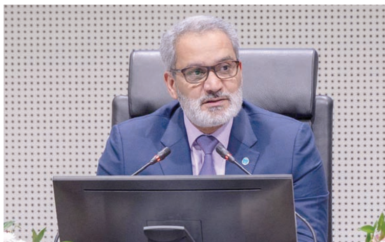
الأمين العام لمنظمة «أوبك» هيثم الغيص

وختم قائلاً: «في ظل هذه الخلفية، يحتاج أصحاب المصلحة إلى إدراك الحاجة للاستثمار المستمر في صناعة النفط، اليوم وغداً، ولعقود عدة في المستقبل، نظراً لأن المنتجات المشتقة من النفط الخام ضرورية لحياتنا اليومية. وأولئك الذين يرفضون هذا الواقع يزرعون بذور نقص الطاقة في المستقبل وزيادة التقلبات، ويفتحون الباب أمام عالم تتسع فيه الفجوة بين (من يملكون الطاقة) و(من لا يملكون الطاقة) بشكل أكبر».