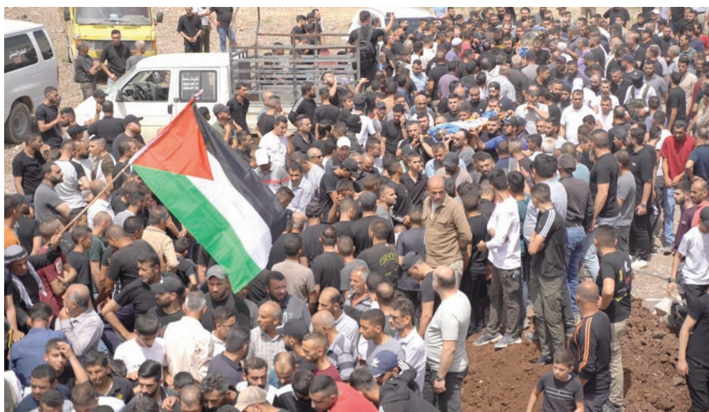
سكان مخيم جنين يشيعون ضحايا العملية العسكرية الإسرائيلية