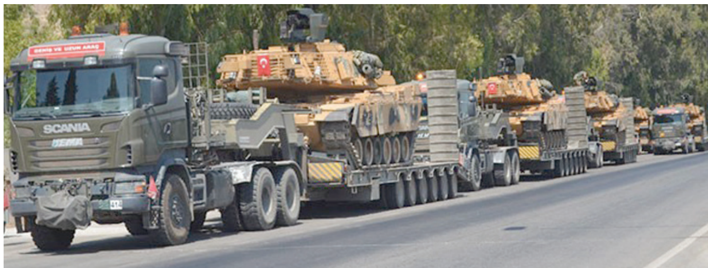
تعزيزات عسكرية تركية إلى إدلب (أرشيفية)

دخل رتل يتألف من 18 آلية تركية محملة بمعدات عسكرية ومواد لوجستية، عبر معبر كفر لوسين الحدودي مع تركيا في شمال إدلب، ليل الأربعاء - الخميس، واتجه نحو النقاط التركية القريبة من محاور الاشتباك في منطقة جبل الزاوية بريف إدلب الجنوبي لتعزيمها. وسبق أن أرسل الجيش التركي تعزيزات إلى المنطقة في 8 أبريل (نيسان) الماضي، وجاءت التعزيزات الجديدة، بعدما استهدف مسلحون مجهولون بقنبلتين يدويتين، نقطة تركية في منطقة بليون جبل الزاوية، جنوب إدلب، دون وقوع خسائر، بحسب ما أفاد «المركز السوري لحقوق الإنسان».