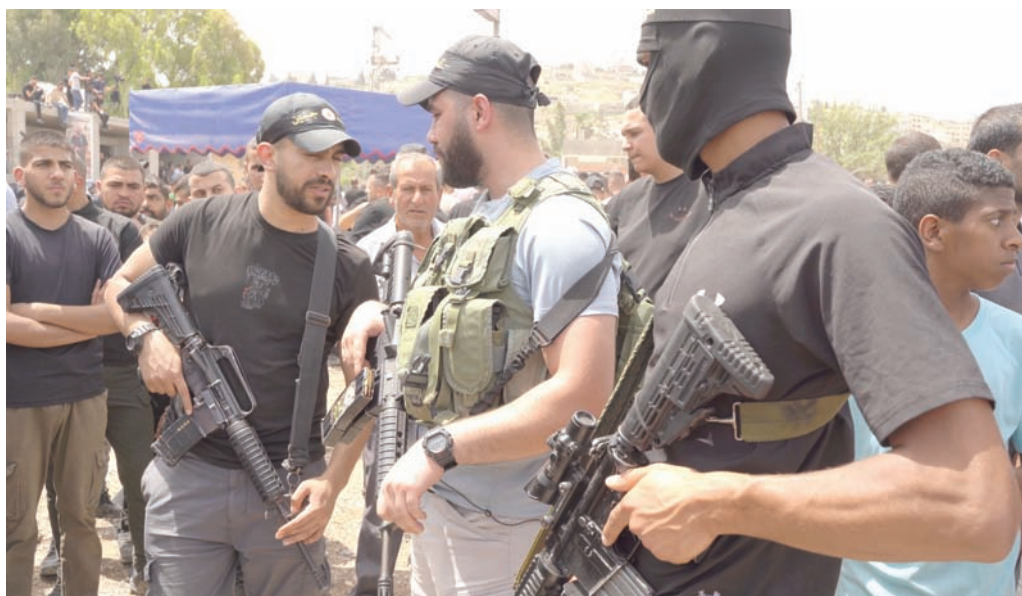
ملاحون من «كتيبة جنين» خلال تشييع جثامين ضحايا العملية العسكرية الإسرائيلية

ترك الرصاص بصمة واضحة على جدران المنازل والمتاجر بين الأزقة الضيقة، فيما تركت الحرائق والساكن على بعض نوافذ البيوت والمسكن المتلاصقة في مساحة ضيقة لا تزيد عن 0,4 كيلومتر مربع، يسكنها نحو 12 ألف نسمة. بدأ نصيب بعض البيوت الأخرى أكبر، إذ لحقها دمار كبير بعد أن قامت الوحدات