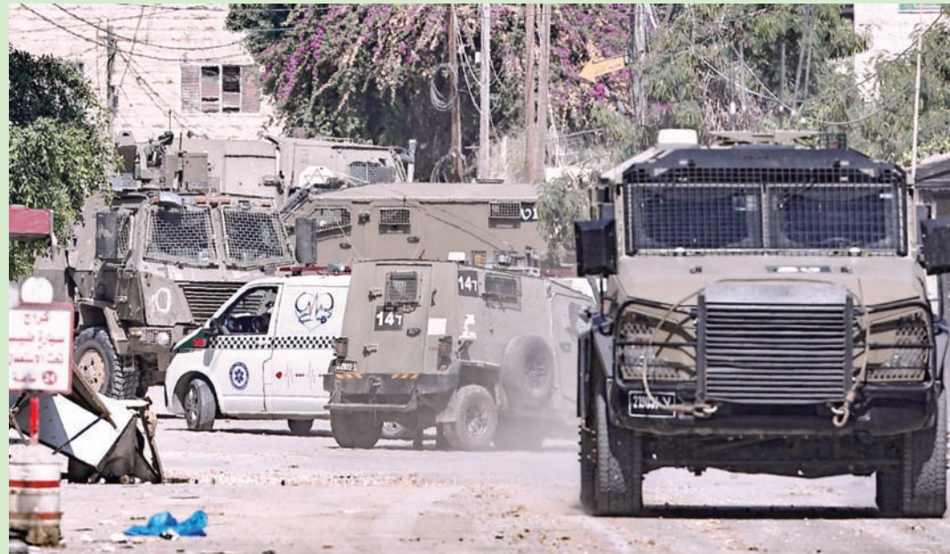
جنين: بهاء ملحم

عربات عسكرية إسرائيلية تحيط بسيارة إسعاف خلال غارة إسرائيلية في مدينة جنين بالضفة الغربية أمس (أ.ف.ب)