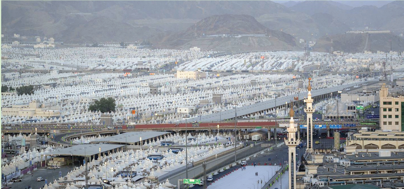
يوجد بمنى ما يُعد أكبر مدينة خيام في العالم على مساحة مقدرة بـ 2.5 مليون متر مربع (واس)

وسخرت «القوات الجوية الملكية» إمكاناتها وقدراتها لتقديم المساندة في تعزيز الإجراءات الأمنية لمنع وقوع أي حوادث تخل بأمن الحج والحجيج، وتؤثر في سلامتهم منذ لحظة وصولهم لاداء المناسك وحتى لحظة مغادرتهم المشاعر المقدسة، حيث تتولى مسؤولية تنظيم وإدارة ومتابعة