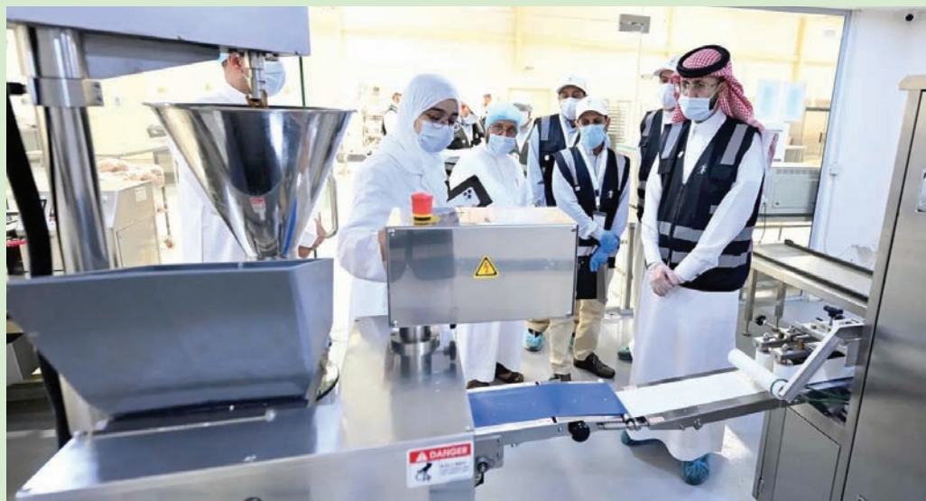
رئيس هيئة الغذاء والدواء يزور منشآت غذائية في مكة المكرمة (واس)

أتاحت الهيئة السعودية للبيانات والذكاء الاصطناعي (سدايا)، للحجاج مجموعة خدمات رقمية عبر تطبيق «توكلنا» بسبع لغات، هي «العربية، والإنجليزية، والفلبينية، والإندونيسية، والبنغلاديشية، والأوردية، والهندية»، وتشمل الخدمات «منتج الرسائل»؛ إذ سيتمكنون من استقبال الإشعارات الخاصة بموسم الحج، علاوة على متابعة حالة الطقس في مكة المكرمة