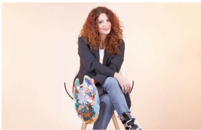
الحاج أدركت الطريق منذ البداية (صور الرسامة)

فنه: «رُدّها: «شلتني في البداية، وفرض عليّ التركيز الكامل لاستعادة الصحة. ثم نُهضت. حين رسمت مجدداً، شعرت بحلاوة الرسم وبتلك الإضافة الجميلة الفارقة. رحّت أطلّح إلى اللوحة بنظرة مغايرة، وأمنحتها تفسيراً آخر». جوائز حصدها بين فرنسا ولبنان وشرم الشيخ في مصر، حين حضرت قاسمات، بينهم نور الشريف ومحمود حميدة معارضها. تبقى بيروت عزيزتها، ولعلّها تشبهها. الاثنان اختارتا النهوض في عزّ الوجع.