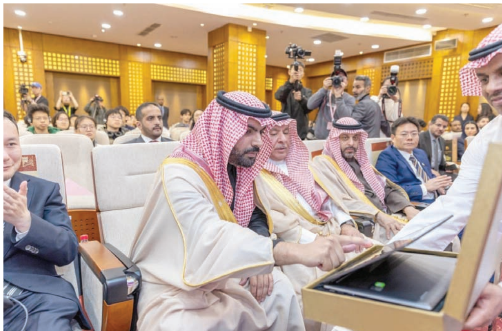
الأمير بدر بن عبد الله بن فرحان خلال إطلاق أعمال الجائزة في بكين

ودشنت السعودية في مارس (آذار) الماضي، أعمال جائزة الأمير محمد بن سلمان للتعاون الثقافي بين السعودية