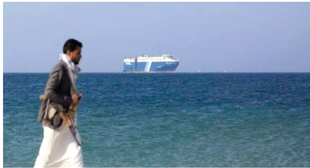
منذ بدء هجمات الحوثيين في البحر الأحمر صدوا أعمالهم القمعية ضد السكان المدنيين

زعمت الجماعة الكشف عنها أخيراً. وزعمت الجماعة الحوثية أن الخلية التي أعلنت ضبطها تمكنت طوال عقود من التأثير على صانعي القرار واختراق سلطات الدولة وتمرير القرارات والقوانين، وتجنيد اقتصاديين ومالكي شركات نفطية وتجارية وربطهم بالمخابرات الأميركية والإسرائيلية، ونفذت أدواراً تجسسية وتخريبية، استمرت حتى بعد خروج السفارة الأميركية من صنعاء في عام 2015، تحت غطاء منظمات دولية وأممية.