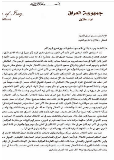
صورة من رسالة علاوي إلى «الشرق الأوسط»

علاوي: الأميركيون أقروا بخطأ حل الجيش وأجهزة الأمن