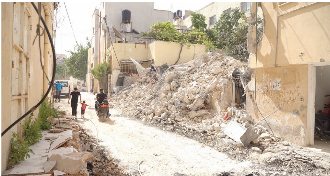
آثار الدمار الذي طال البيوت في مخيم جنين