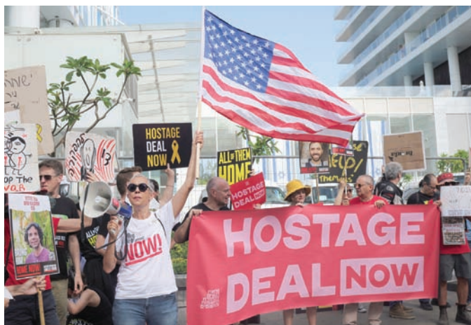
احتجاج عائلات الرهائن خارج اجتماع لوزير الخارجية الأميركي في تل أبيب 11 يونيو

وتساءل عن هدف الحرب الحالية في القطاع: «من هم هؤلاء القادة في كل المستويات