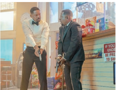
«باد بويز» (رايد أور داي)

مرسومة ببعض العمق (ناهيك عن عدم ملاءمة البطلة لل دور) لكن الفيلم أضاف بعض النقاط الإيجابية لهذه البلاء المصوّرة. لكن الغاية منه هي توظيف معطيات لا منطق لها في نتائج لا قيمة لها.