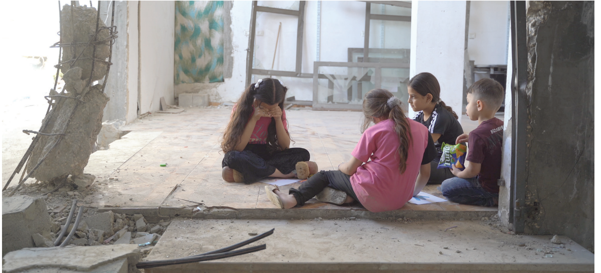
أطفال يلعبون داخل بيت دمرته الجرافات الإسرائيلية في مخيم نور شمس (الشرق الأوسط)

في غزة. تزامن وصولنا لمداخل المدينة مع بدء العملية العسكرية الإسرائيلية وتصاعد القتال فيها.