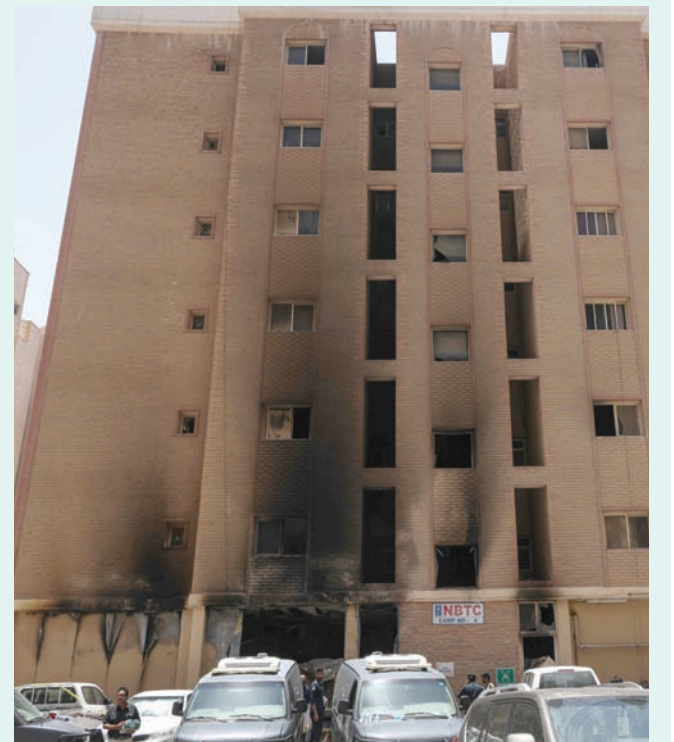
استمرار إجراءات التحقيق في حادث حريق المنقف بالكويت