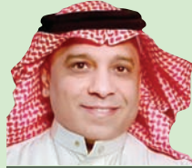
مبارك بن عبدالعزيز