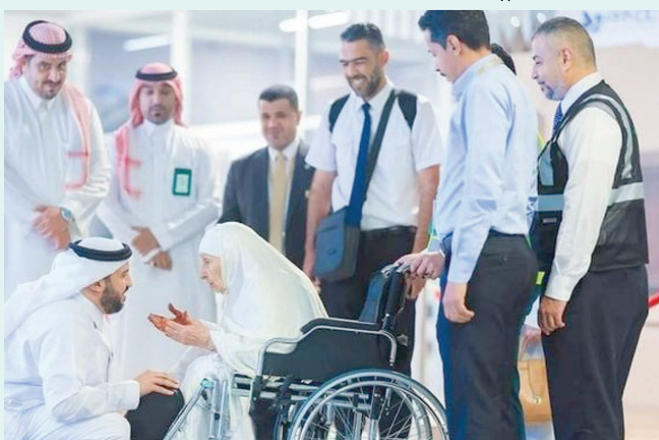
انتشرت صور لصرهودة على منصة «إكس» وهي تستقبل بحفاوة في المملكة

وكانت السعودية قد استقبلت ضيوف الرحمن في مكة المكرمة، واحتفت باكمال وصول أفواج الحجاج من دول متعددة حول العالم إلى العاصمة المقدسة.