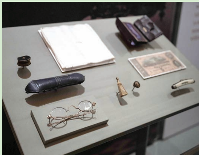
أشياء أبراهام لنكولن

من محتويات جيوب أبراهام لنكولن ليلة اغتياله، إلى الواح الرسم