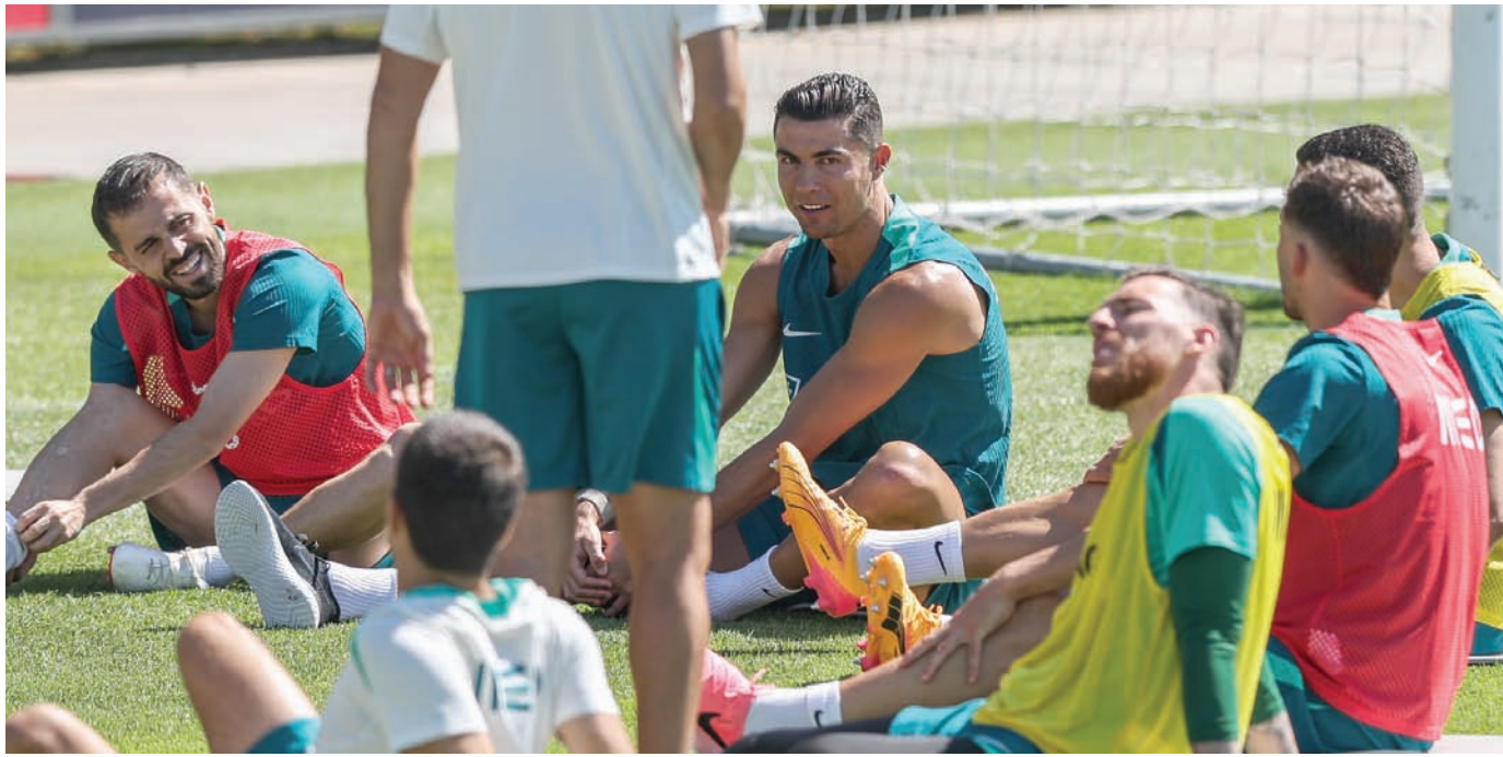
رونالدو خلال تدريبات البرتغال التحضيرية لكأس أوروبا

وقال العيسى: «بعض المدربين لم يكتفوا باستدعاء اللاعبين، بل حضروا بأنفسهم لمشاهدة مباريات الدوري السعودي من الملعب للاطلاع على جاهزية لاعبيهم، مثل روبرتو مارتينيز الذي حضر في وقت سابق لمتابعة رونالدو وبقية لاعبي المنتخب البرتغالي، وكذلك الحال مع رونالدو كومان الذي شاهد إحدى مباريات الاتفاق في الدوري».