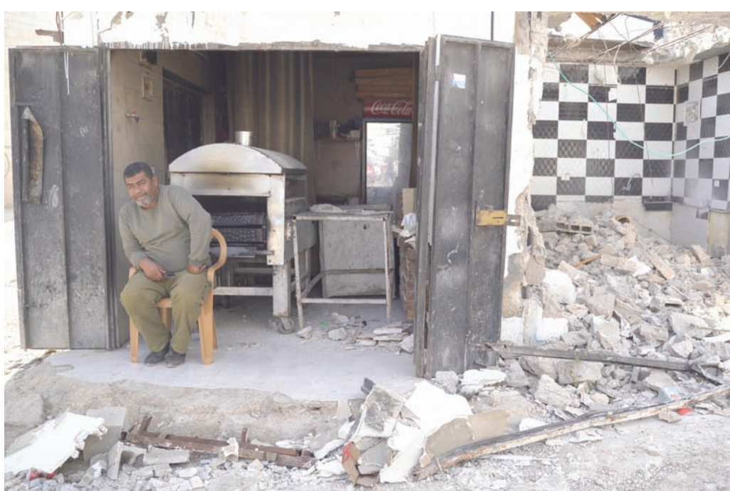
آثار الدمار الذي طال البيوت والمتاجر في مخيم جنين

استراتيجية تحمل مؤشرات بالمضي لـ«الحسم الشامل». كانت الضفة الغربية شهدت أكثر من 460 عملية إطلاق نار واشتباك منذ بداية العام الحالي، استهدفت قوات الجيش والمستوطنين، وأوقعت 13 قتيلاً وعشرات الإصابات.