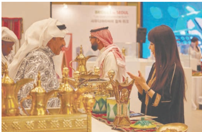
معرض «جسور إلى سيول» الذي نظمه مركز «أثراء» عام 2019 في سيول

وخلت السعودية في فبراير (شباط) الماضي، ضيف شرفي على معرض الكتاب الدولي في العاصمة الهندية نيودلهي، وسجل الجناح السعودي حضوراً واسعاً من الجمهور الهندي، وحظي بعدد كبير من الزائرين للتعرف على الثقافة والفنون والتراث السعودي في تجربة ثقافية متكاملة.