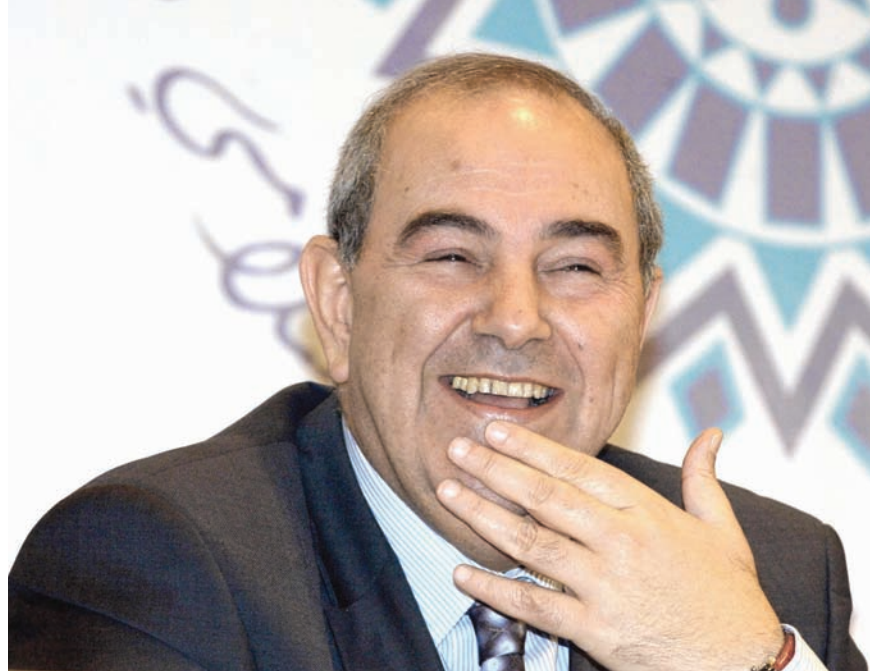
رئيس الوزراء العراقي السابق إياد علاوي

كشف رئيس الوزراء العراقي الأسبق، إياد علاوي، كواليس منعه من تسلّم المنصب رغم فوزه بالانتخابات التشريعية عام 2010، خلال شهادة خاصة بعثها رداً على حوار أجرته «الشرق الأوسط» مع السياسي والشاعر فخري كريم. وقال علاوي، خلال رسالة مفصلة، إن الرئيس الأميركي الحالي جو بايدن، طلب منه حينها أن يتولى منصب رئيس الجمهورية، وأن يعمل على إقناع السنة وبينما واشنطن تعالج مسألة مسالة الكرد. وأفرد فخري كريم خلال الحوار الذي نشرته «الشرق الأوسط» على مدار 3 حلقات الأسبوع المنصرم، شهادة مطولة عن العملية السياسية، بدءاً من المعارضة حتى تشكل حكومات ما بعد صدام حسين، واعترف كريم بأنه ارتكب خطأ كبيراً حين فضل بقاء المالكي على إعطاء رئاسة الحكومة لعلاوي، الذي فاز بالأكثرية في مجلس النواب.