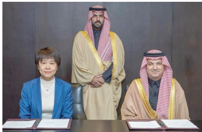
توقيع عقد استضافة المملكة ضيف شرف في معرض بكين الدولي مارس الماضي (واس)

بالإضافة إلى كثير من الهيئات الثقافية، مشاركة وزارة الاستثمار، لترويج الفرص الاستثمارية في المملكة، خصوصاً في القطاع الثقافي، ومشاركة لدارة الملك عبد العزيز، وتجمع الملك سلمان العالمي للغة العربية، ومكتبة الملك عبد العزيز العامة، ومكتبة الملك فهد الوطنية، وجمعية النشر السعودية. ويسعى التنوع في