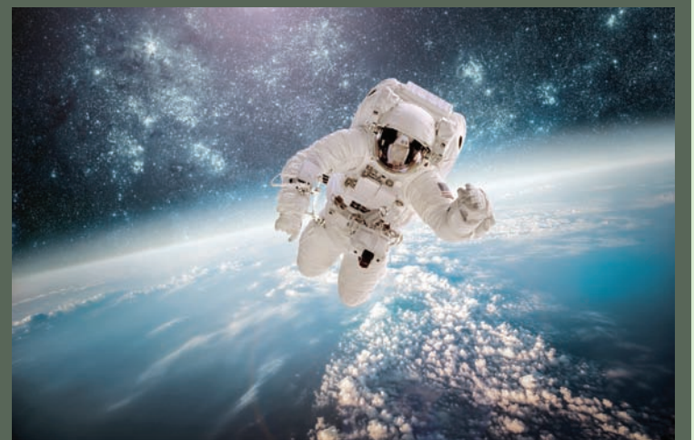
العلاقة بالفضاء تعود بارتدادات

وقال كريستوفر مايسن من كلية طب وايل كورنيل في نيويورك: «هذا هو البحث الأكثر تعمقاً على الإطلاق الذي نجريه على أحد الطواقم».