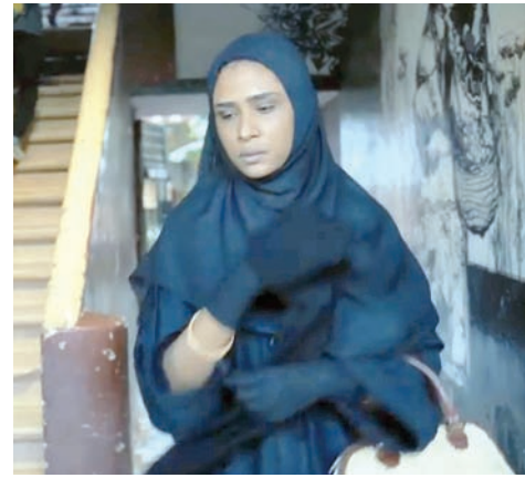
«وداعاً جوليا» (ستايشن فيلمز)

أغلقت صالات السينما وخزمت الأفلام على أساس أنها منافية للشريعة والإسلام. الحال هو أن المخرجين السودانيين الذين حققوا أفلامهم في سنوات ما بعد الاستقلال وجدوا أنفسهم بلا عمل أو اضطروا للهجرة إلى ألمانيا أو الإمارات العربية المتحدة أو مصر أو السويد. هذا بدوره ليس طريقاً جيداً لتحقيق صناعة محلية على الرغم من الانفتاح الذي حصل قبل 3 أعوام حين استعادت بعض الصالات نشاطها ووضّرت أفلام كثيرة بدت مثل واحات وسط الصحاري. ثلاثة من هذه الأفلام تستحق الذكر هنا، أولها «الحديث عن الأشجار»