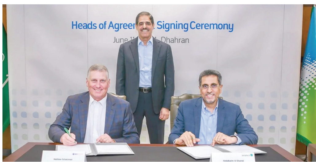
جانب من حفل التوقيع على الاتفاقية

وكانت «أرامكو» أعلنت في سبتمبر (أيلول) من عام 2023 دخولها إلى أعمال الغاز الطبيعي المسال العالمية من خلال استحواذها على حصة بقيمة 500 مليون دولار في شركة «ميد أوشن إنرجي» التي تديرها «إي إي جي»، التي أكملت في عام 2024 الاستحواذ على حصص في مشاريع الغاز الطبيعي المسال في أستراليا وبيرو. وقالت «أرامكو» في تقريرها العام الماضي إنها تتوقع نمواً قوياً يقوده الطلب على الغاز الطبيعي المسال، وإنها تخطط لتطوير أعمال عالمية متكاملة في مجال الغاز الطبيعي المسال وتوسع إلى تحقيق الاستثمار المباشر وفرص المشاريع المشتركة.