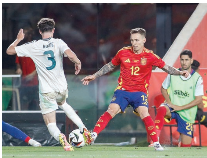
لم يكن بإمكان لويس دي لا فوينتي مدرب منتخب إسبانيا أن يتجاهل غريمالدو (يمين،)

كان يُنظر إلى ميتلشتات على أنه لاعب واعد في هيرتا برلين، لكنه لم يصل مع الفريق إلى ربع إمكاناته في حقيقة الأمر. وبعد هيرتا برلين، انتقل ميتلشتات إلى شتوتغارت الصيف الماضي مقابل 500 ألف يورو. كانت التوقعات منخفضة للغاية بشأن هذا اللاعب، لكنه تألق بشدة وقاد الفريق لاحتلال المركز الثاني متقدماً على بايرن ميونيخ. لقد ساعد المدير الفني سيباستيان هونيس، ميتلشتات على تقديم أفضل ما لديه داخل الملعب، وهو الأمر الذي صب في مصلحة المنتخب الألماني أيضاً. لقد كان ميتلشتات رائعاً في أول مباراة دولية له ضد فرنسا في مارس (آذار) الماضي، وسجل هدفاً في مرعى هولندا في مباراته الثانية، وأصبح الآن ركيزة أساسية في صفوف