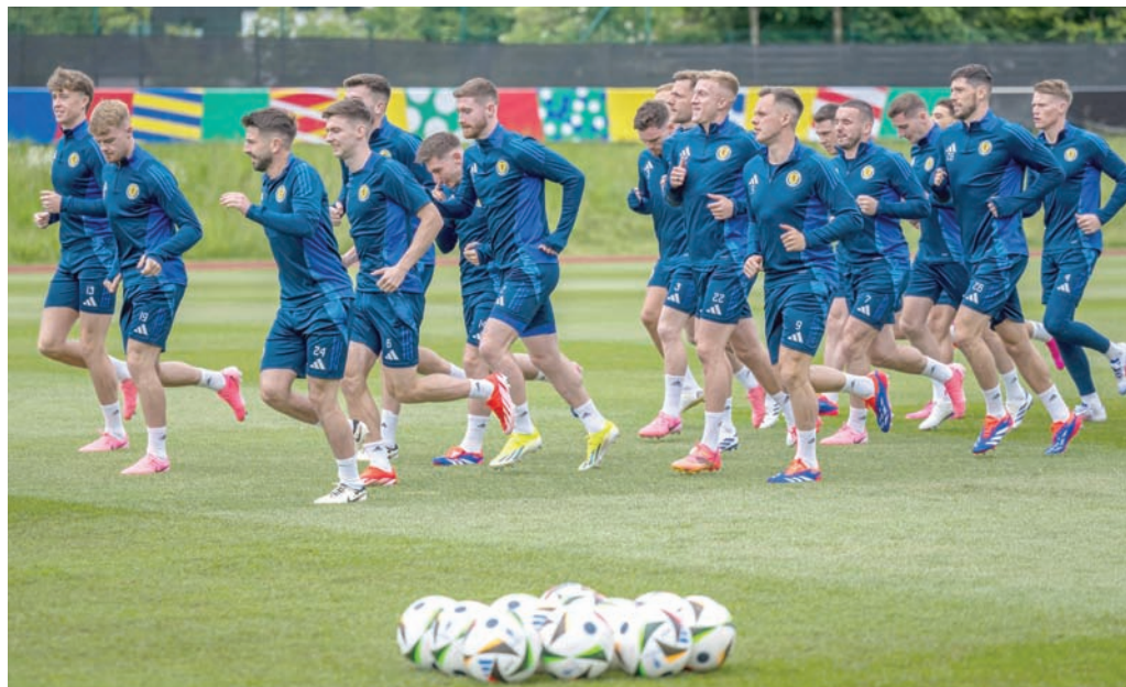
لاعبو المنتخب الاسكتلندي وآثون من قدرتهم على تحقيق نتيجة إيجابية أمام ألمانيا في افتتاح كأس أوروبا

ويجمع المنتخب الألماني مزيجاً من عناصر الخبرة مثل مانويل نوير حارس المرمر وزميله في بايرن ميونخ توماس مولر وجوشوا كيمييتش إضافة إلى ثنائي ريال مدريد أنطونيو روديجر وتوني كروس، والكاي غوندوغان الذي سيحمل شارة القائد، وشباب واعد مثل موسيالا وفيرتز وكاي هافيرتز وليروي ساني، وجونانان تاه وروبرت أندريتش. وانضم في اللحظات الأخيرة إيمري تشان لاعب وسط بوروسيا دورتموند مكان الشاب الكسندر بافلوفيتش الذي خرج من القائمة بسبب الإصابة.