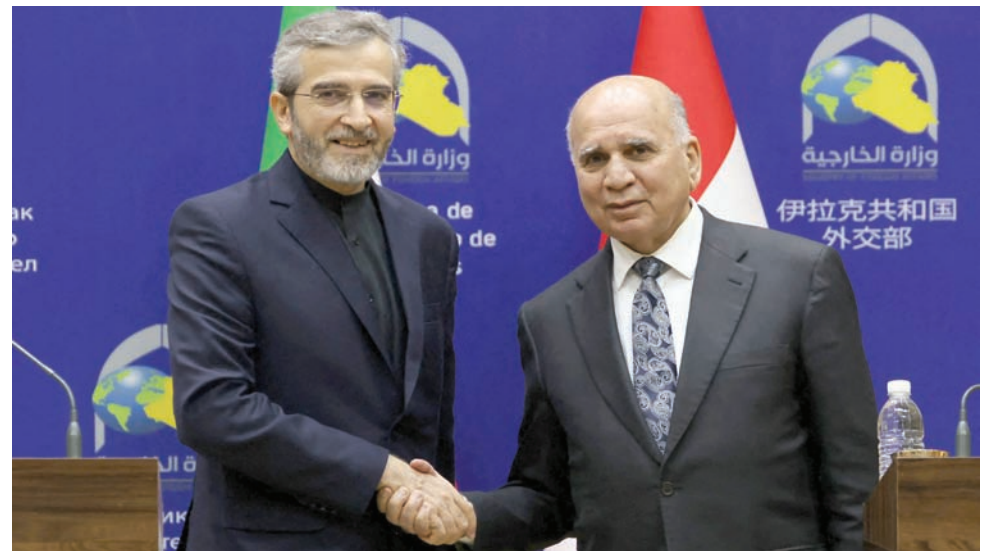
وزيرا خارجية العراق وإيران خلال لقائهما في بغداد أمس