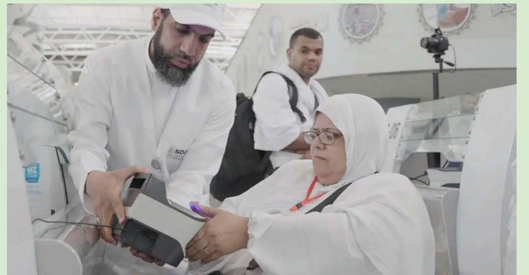
مجموعة خدمات رقمية أتاحتها «سدايا» عبر تطبيق «توكلنا» بسبع لغات