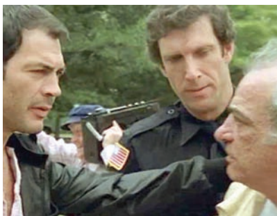
«تمساح» (أطلس إنترناشيونال)