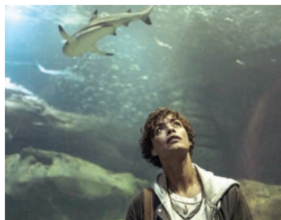
«تحت باريس» (لت مي بي)