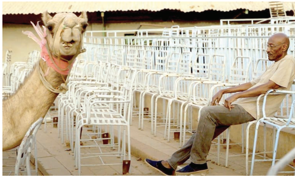
«الحديث عن الأشجار» (أغات فيلمز)