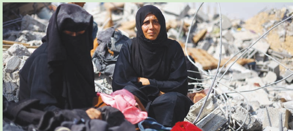
شقيقتان مصدومتان تبعثان عن أهمها المفقودة تحت أنقاض منزل دُمّرته ضربة إسرائيلية في خان يونس جنوب قطاع غزة أمس