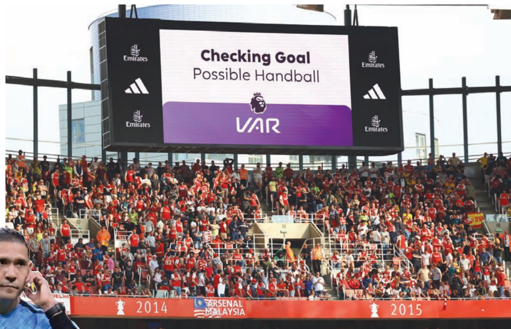
جماهير كرة القدم تشعر بالضرر من تقنية «الفار» لأنها لا تشاهد إعادات الفيديو

شاشات التلفزيون على مشاهدتها من الملعب. فبالنسبة لمشاهدة المباريات من الملعب، تكون تقنية «فار» شيئاً مروعاً حقاً، حيث لا يتعلق الأمر فقط بتوقف المباريات كثيراً وفقدان سلاستها، أو بانه من الصعب الاحتفال بالهدف من دون معرفة ما إذا كان من الممكن إلغاؤه بسبب تدخل بعض الأشخاص البعيدين تماماً عن اللعبة؛ وإنما يتعلق الأمر بالدقائق الطويلة التي تتوقف فيها المباراة انتظاراً لقرار حكم الفيديو، دون أن يكون هناك أي شيء يمكن للجمهور الموجود في الملعب مشاهدته، سوى اللاعبين الذين ينتظرون أيضاً