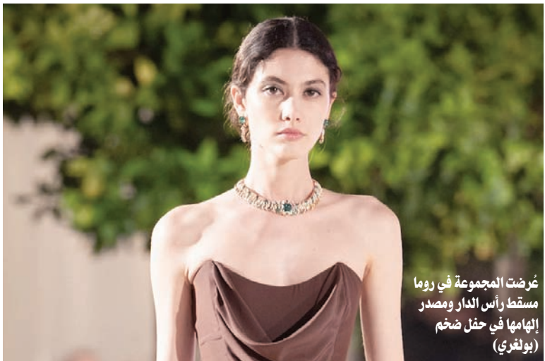
عُرِضت المجموعة في روما مسقط رأس الدار ومصدر إلهامها في حفل ضخم (بولغري)