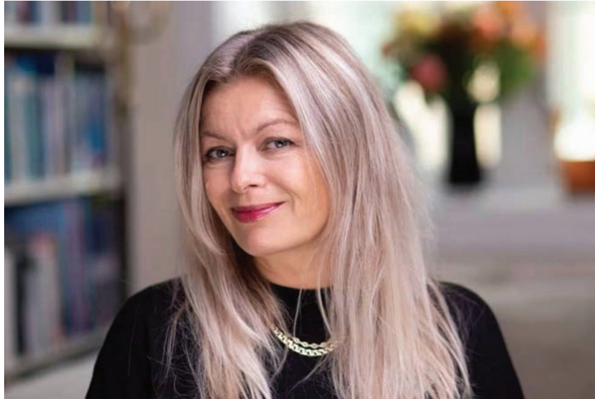
الكاتبة النرويجية لين ستالسبيرغ

كيف تدمر الليبرالية الجديدة البشر والطبيعة! لين ستالسبيرغ كيف تدمر الليبرالية الجديدة البشر والطبيعة ترجمة شيرين عبد الوهاب رسمت علي أمين