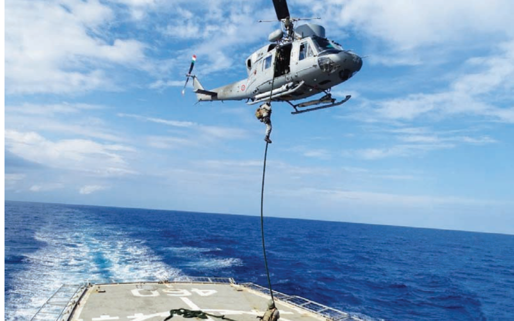
واحدة من عمليات التفتيش قبالة الساحل الليبي في ديسمبر 2022

وتتباين وجهات النظر السياسية والعسكرية في ليبيا بشأن «إيريني» منذ تشييدها، فهناك من يراها «متحيزة في تطبيقها للحظر، ما يسهم في مواصلة الصراع العسكري بدلاً من إنهائه»، غير أن الأكاديمي والباحث السياسي التركي، مهرداد أوغلو، يرى أن «كل طرف في ليبيا لديه توجس وعدم ثقة كامل، لذلك يستمر تدفق السلاح غير الشرعي إلى البلاد».