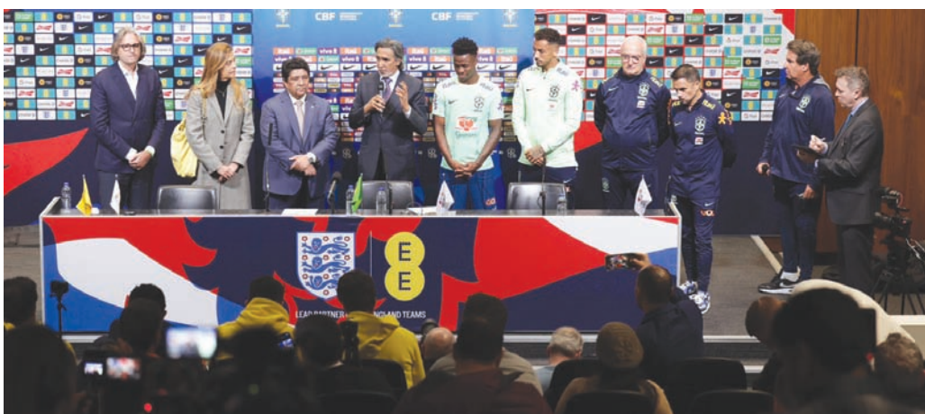
الاتحاد البرازيلي وقع عقد شراكة مع المركز الدولي للأمن الرياضي خلال مارس الماضي

● ما أهم الإنجازات التي تحققت في مجال أمن