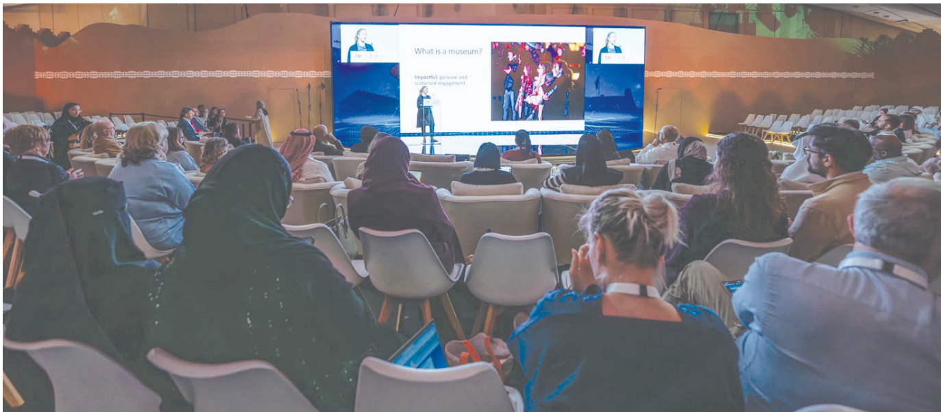
اجتماع دولي هو الأول من نوعه بالمنطقة العربية لتأسيس حقبة جديدة في دور المتاحف (هيئة المتاحف)

وختم أصلا حديثه قائلاً: «لقد اتضح لنا من خلال هذا المؤتمر ريادة السعودية في هذا القطاع، وبأن الجهود التي قامت بها مؤخراً، تعكس مستوى الالتزام والوعي بقيمة القطاع المتحفي، وخلال عملي في المكتب الإقليمي، تابعت تطور القطاع المتحفي في السعودية، ولست عن كتب اهتمام السعودية بمواكبة التطور فيه، وأرى اليوم حرصاً على بناء توجهات واستراتيجيات مبتكرة لدى المتخصصين في المملكة، وهي خطوة نتمناها نموذجاً يمكن الاحتذاء به من قبل دول العالم العربي».