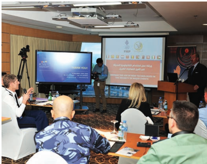
من إحدى ورش العمل حول استخدام التكنولوجيا لتأمين الفعاليات الكبرى (الشرق الأوسط)

دونتي» التي تروج لنظام متكامل للأمان والأمن والخدمة. ولا يمكن فصل أمان الفعالية عن التجربة الشاملة لها، ويجب أن تستفيد الموارد المستخرجة في هذه العناصر الثلاثة بعضها من بعض. وفي المركز الدولي للأمن الرياضي، أضفنا خاصية الإدماج الاجتماعي. ومن الأساسي العمل مع المجتمعات المعرضة للخطر ودمجها قدر الإمكان خلال التحضير وتنفيذ الفعالية. تمثل الفعاليات الرياضية الكبرى فرصاً فريدة لتكثيف هذه المجتمعات، وخلق وظائف جديدة وتحسين المناطق الحضرية غير المجهزة.