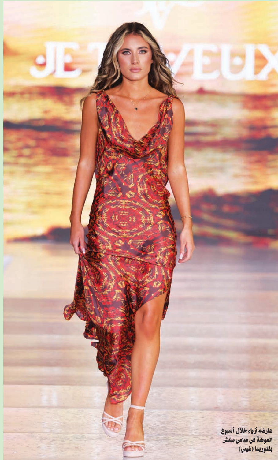
عارضة أزياء خلال أسبوع الموضة في ميامي بيتش بفلوريدا