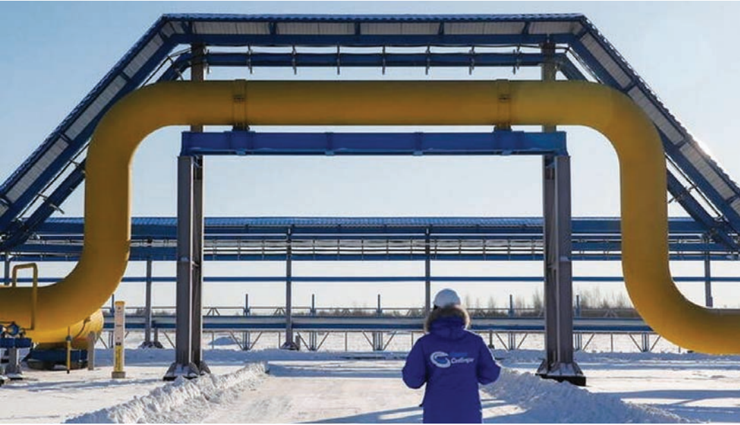
موظف يمر عبر جزء من خط أنابيب الغاز التابع لشركة «غازبروم» في سيبيريا

خط الأنابيب بسرعة إلى حد ما، حيث تم تطوير حقول الغاز بالفعل. وفي النهاية، ليس لدى الروس أي خيار آخر لتسويق هذا الغاز.