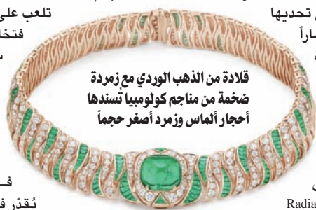
قلادة من الذهب الوردي مع زمردة ضخمة من مناجم كولومبيا تسدّها أحجار الإلماس وزمرد أصفر حجماً

متوثية. غني عن القول بأن لوتشيا سيلفيستري لم تبخل على المصممة الشابة بخبرتها. تابعت كل خطواتها وأسدت إليه النصائح في كل مرة احتاج الأمر إلى تلميح أو تنويه، مع توفير كل ما غلا ثمنه من الأحجار الكريمة. فعلى مدى عقود، ظلت الأحجار النادرة ذات الأحجام الضخمة ممكنة قوة دار «بولغري». تلعب على ألوانها المتضاربة فتلحق تانغماً لا يتقنه سوى رسام مبدع، الآن وأكثر من أي وقت مضى، تحتاج إلى كل ما هو متوهج وجاذب لكي تبقى في صدارة عالم يُقدّر فيه الحس الإبداعي بما لا يبالي بالدولارات.