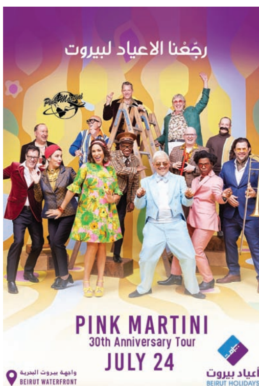
«بينك مارتيني» ضيف «أعياد بيروت» (ستار سيستم)

يقام تحت عنوان «رجعنا الأعياد لبيروت» يندرج اسم الموسيقي غي مانوكيان، فيقدم حفلاً خاصاً بعيد الأضحى في 22 يوليو، يرافقه موسيقيون من اليونان، إضافة إلى فريقه من عازقين لبنانيين.