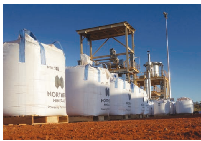
أوضحت «نورثرن مينيرالز»، أن الأسهم المقرر التصرف فيها تبلغ 10,4% من رأسمالها (موقع الشركة)

في هذا الصدد، تشير معلومات منظمة «أوبك»، إلى أنه من المتوقع في ظل النمو الاقتصادي العالمي أن يزداد الطلب على النفط في عام 2024 نحو 2,2 مليون برميل يومياً، كما يتوقع استمرار ارتفاع الطلب خلال عام 2025 لنحو 1,8 مليون برميل يومياً، مقارنة بالعام الماضي، ليسجل معدل الاستهلاك النفطي العالمي في عام 2025 نحو 106,3 مليون برميل يومياً. وبالمناصفة، هذا أعلى معدل استهلاك نفطي سنوي عالمي إلى الآن، وهو ما يفسر، أكثر من أي سبب آخر، الاهتمام الذي تبدیه صناعة الطاقة بالصناعة الهيدروكربونية.