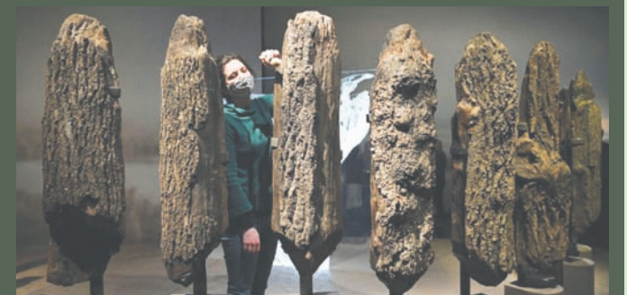
تم العثور على الهيكل القديم في نورفولك بواسطة الرمال المتحركة

وكان قد تم الكشف عن الهيكل القديم الغامض لأول مرة في عام 1998 نتيجة تحرك الرمال على شاطئ هولي نيكست