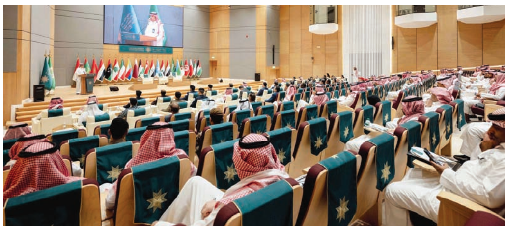
جانب من ندوة إدارة وتأمين الأحداث الرياضية الكبرى التي نظمتها جامعة نايف العربية في الرياض