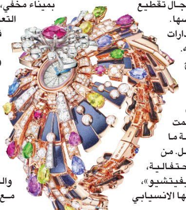
ساعة «فواكي دارتيفيتشيوي» السرية من مجموعة المجوهرات الفاخرة... حجم صغير (بولغري)

و450 ساعة من العمل المتواصل. هذا الوقت يعود إلى ما تطلبه العمل من دقة في جمع توليفة متنوعة من الأحجار الكريمة الملونة بأشكال وأحجام مختلفة. السوار مثلاً جاء من الذهب الوردي والتيتانيوم الأزرق في محاكاة مقصورة للون السماء وخلق تباين درامي مع العقيق الداكن. كذلك ساعة «فينيتشي» المميزة بميناة مخفي، وحركة ميكانيكية يدوية التعبئة من طراز بيكوليسيمو فائقة الصغر والدقة، مع احتياطي طاقة لمدة 30 ساعة. شكلاً، تتميز بهيكل من الذهب الأبيض والذهب السوردي مع حجر واحد تورمالين بارابايا يقطع الكمفري (وزن 9,78 قيراط)، وأحجار ياقوت زفير أزرق يقطع المخطول والقطع البضاوي المخطول مع ترصيعات متجاورة وياقوت زفير وريدي، وياقوت زفير أرجواني ونترانيت وتورمالين بارابايا وأكوامارين وإبوليت وعقيق وردي ورودوليت وروبلييت وتورمالين وردي وجمشت والإلماس. هذه التوليفة الغنية منحت حرفيي الدار من صياغة تحفة تضاهي جمالها وقيمتها أعلى المجوهرات التي يمكن الحصول عليها.