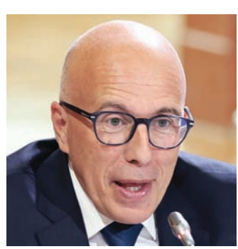
إريك سيوتي رئيس «الجمهوريون» اليميني

واتهم بن قرينة، الذي كان وزيراً، رئيس «الجمهوريون»، بـ«إثارة الكراهية والعنصرية تجاه الجالية الجزائرية بفرنسا، وهي التي أعطت أحسن الأمثلة على احترام البلد المضيف، بل وقدمت أحسن