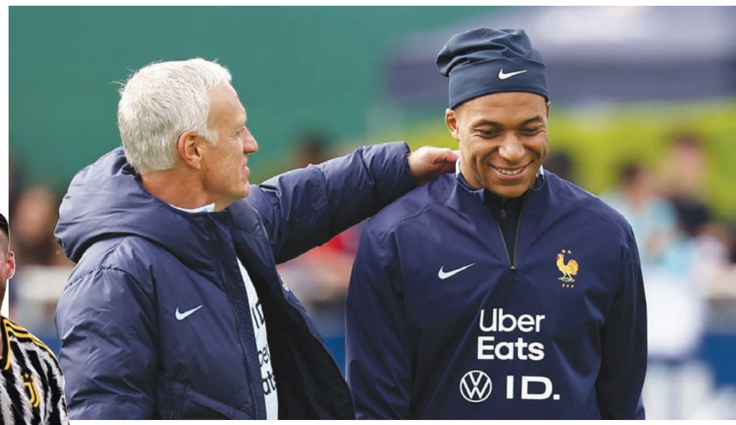
مباني مع المدرب ديشامب في معسكر المنتخب الأول للإعداد لبطولة «يورو 2024»...

على جانب آخر، تلقى خط دفاع المنتخب الإيطالي، بطل أوروبا لكرة القدم، ضربة معنوية قوية