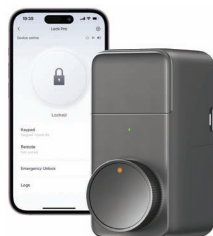
* «سويتش بوت لوك برو» يعمل مع التطبيقات الهاتفية

دولار، وهو يعمل مع أنواع أقفال متعددة في جميع أنحاء العالم لترقية أقفال الأبواب القديمة بسهولة إلى أقفال ذكية.