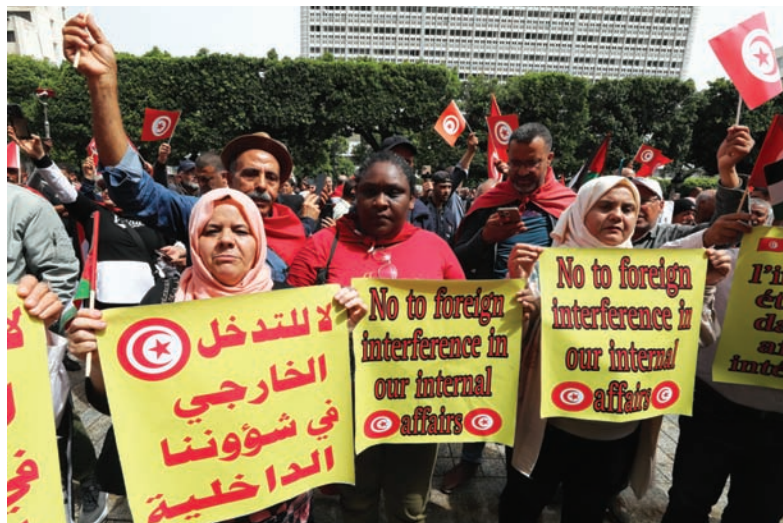
مظاهرة مؤيدة للرئيس التونسي في العاصمة أمس

واعتقلت الشرطة هذا الشهر 10 أشخاص على الأقل، من بينهم صحفيون ومحامون ومسؤولون في منظمات من المجتمع المدني، فيما وصفتها منظمة العفو الدولية ومنظمة «هيومن رايتس ووتش» بأنها «حملة قمع شديدة». ودعت المنظمات تونس من قبل إلى «احترام حق التونسيين في حرية التعبير والحريات المدنية».