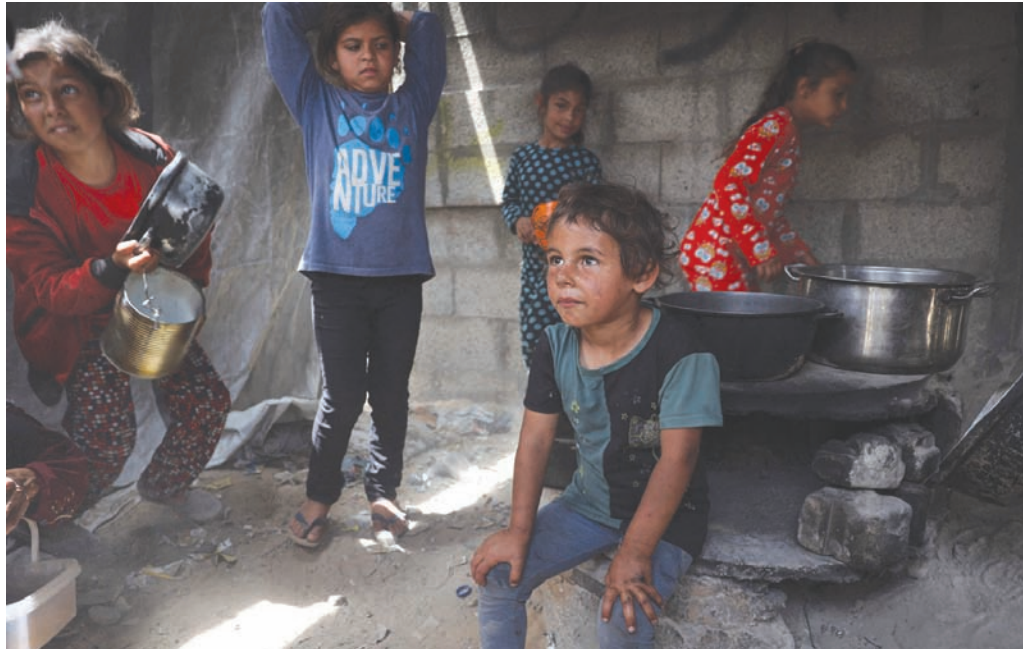
أطفال فلسطينيون في رفح ينتظرون الحصول على الطعام أمس

في غزة، دقيقة وتهدف إلى منع «حماس» من إعادة إحكام قبضتها هناك. وأضاف أنه «يعمل على تحديد خلايا (إرهابية) مسلحة... وينفذ عشرات الضربات لمساعدة القوات العاملة على الأرض» في منطقة جباليا. من جهته، أكد الدفاع المدني في قطاع غزة أن القصف الإسرائيلي يستهدف منزلاً في مخيم النصيرات للاجئين. وقال المتحدث باسمه محمود بصل لوكالة الصحافة الفرنسية: «تمكنت طواقم الدفاع المدني بمحافظة الوسطى من انتشال 31 شهيداً،