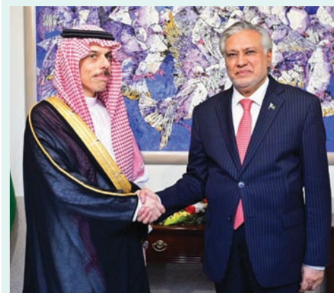
الأمير فيصل بن فرحان وزير الخارجية السعودي مع نظيره الباكستاني محمد دار في لقاء سابق

كما ناقش الأمير فيصل بن فرحان خلال الاتصال الذي أجراه مع الوزير دار العلاقات الثنائية بين البلدين الشقيقين، وفرص تطويرها في شتى المجالات. وبحث الوزيران الترتيبات الأولية لزيارة الأمير محمد بن سلمان ولي العهد رئيس مجلس الوزراء السعودي إلى باكستان، التي سيتم تحديدها موعداً في وقت لاحق باتفاق الطرفين.