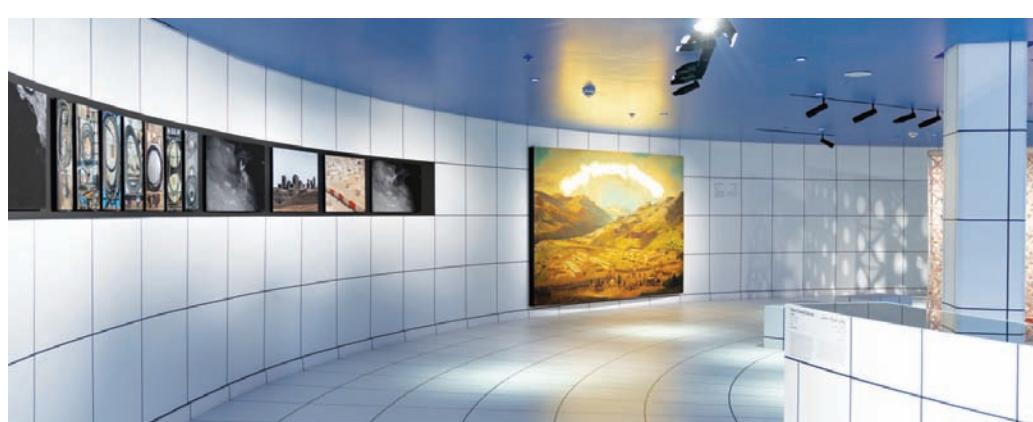
جانب من معرض «السفارة الافتراضية»

ويوجد أيضاً مجموعة مختلفة من التأمّلات يظفر بها زائر معرض «السفارة الافتراضية»، وهو يتأمل في الأعمال التي تعيد انتباه الناظر في تفاصيلها وتراكيبها إلى الكثير من المفاهيم، واستشراف غير المتوقع من مال البشرية، ومن ذلك أعمال الكوينية أسيل يعقوب التي تكشف من خلالها الحقيقة والخيال الجماعي الكويتي ما بين 1940 و1980، عن طريق توظيف دقيق لتفكيك وإعادة تجميع طوابع الأرشيف العائدة إلى تلك الحقبة، وتكرار النظر في السرديات وإعادة بنائها وتشكيلها في روايات خيالية متعددة الحكبات ومتجاذبة الرغبات.