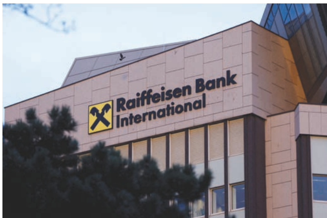
حذرت واشنطن مصرف «رايفايزن» من تقييد وصوله إلى الدولار بسبب روسيا (رويترز)

الأميركي في عام 2018. ويدعو المصرف المركزي مصارف منطقة اليورو إلى البحث عن مخرج من روسيا، منذ أن سنت موسكو حربها على أوكرانيا في فبراير (شباط) 2022. فمن ناحية، طلب من مصرف «رايفايزن الدولي» الذي يتمتع بأكثر تعرض لروسيا بين المقرضين الأوروبيين، أن يخفف إقراضه في البلاد بمقدار الثلثين عن مستواه الحالي بحلول عام 2026. ويواجه المصرف غرامات محتملة من قبل المصرف المركزي الأوروبي إذا فشل في الامتثال، وقلص بالفعل دفتر قروضه الروسية بنسبة 56 في المائة منذ بدء الحرب.