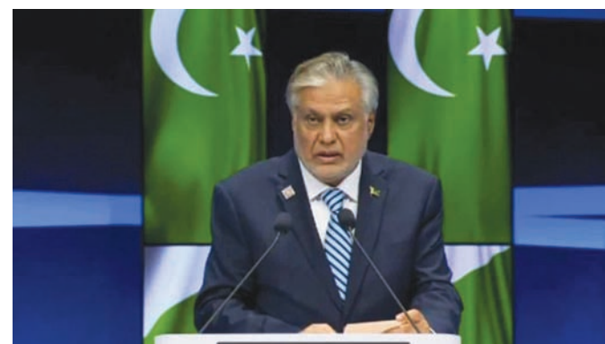
وزير الخارجية الباكستاني محمد إسحاق دار

من جميع المصادر، لأنها تزيد من عدم التوازن العسكري في المنطقة وتقوض الاستقرار الاستراتيجي».