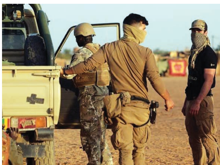
أرشيفية لعناصر من مرتزقة مجموعة «فاغنر» الروسية في مالي

تحتفظ هذه العمليات الإرهابية المخطط لها بهدف تنفيذ تطهير عرقي مُستهدف وتهجير سريع للسكان الأصليين في إقليم أزواد». وفقدت الجماعات الانفصالية، وغالبية عناصرها من الطوارق، السيطرة على مناطق عدة في الشمال نهاية عام 2023 بعد هجوم شنه الجيش المالي وبلغ ذروته بالسيطرة على مدينة كيدال، معقل الانفصاليين. وتجددت الأعمال العدائية في أغسطس (آب) 2023 بعد ثماني سنوات من الهدوء بين الحكومة والانفصاليين الذين تناقشوا للسيطرة على الأراضي والمعسكرات التي أخلتها قوة حفظ السلام التابعة للأمم المتحدة بطلب من بامako. وحقق العسكريون الذين استولوا على السلطة بالقوة عام 2020 نجاحاً بالسيطرة على كيدال لاقى استحساناً واسعاً في مالي، لكن المتطرفين لم يلقوا أسلحتهم وتفرقوا في شمال البلاد الصحراوي والجبلي. وتلقت القوات الحكومية المالية الدعم في عملياتها من مرتزقة روس، وفق المتطرفين ومسؤولين محليين منتخبين، رغم نفي المجلس العسكري. ووافقت الهجوم في شمال مالي اتهامات عدة بارتكاب الجيش المالي وحلفائه الروس انتهاكات