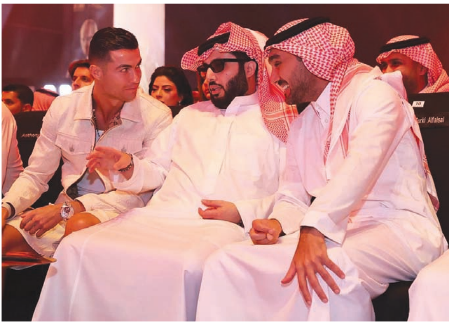
الفيصل وتركي آل الشيخ ورونالدو في حديث خلال النزال (موسم الرياض)