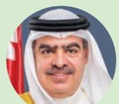
فواز بن محمد آل خليفة

فواز بن محمد آل خليفة، سفير مملكة البحرين لدى المملكة المتحدة، أقيم أول من أمس، حفل الاستقبال الصفي لجمعية أصدقاء البحرين لدى المملكة المتحدة، بمقر البرلمان البريطاني في قصر وستمنستر، وهي تعد من أوائل جمعيات الصداقة البريطانية في المنطقة حيث تم تأسيسها في عام 1965. وأكد السفير في كلمته عمق العلاقات التاريخية بين المملكتين الصديقتين، والتعاون البناء والمتنامي في شتى المجالات، مشيراً إلى دور مملكة البحرين المحوري في الحفاظ على السلم والأمن الدوليين بالتعاون مع الحلفاء والأصدقاء.