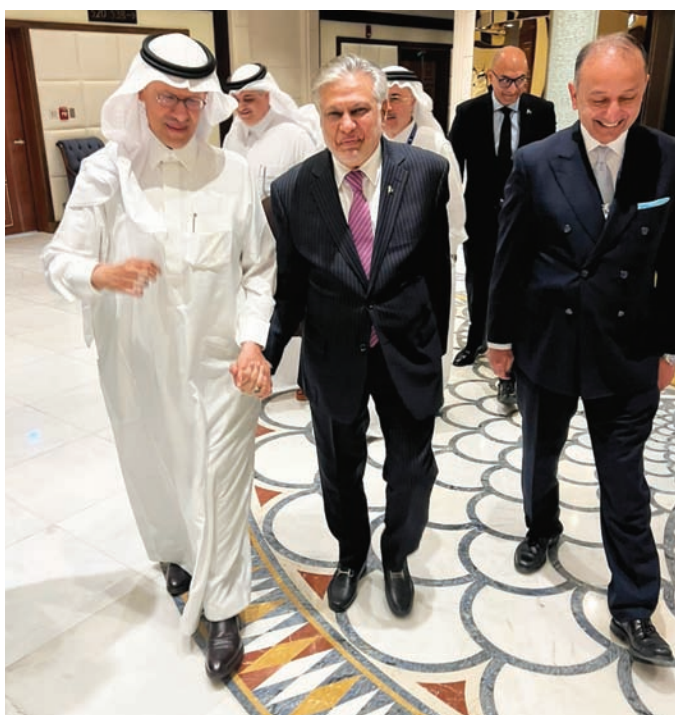
وزير الطاقة السعودي الأمير عبد العزيز بن سلمان في لقاء سابق مع وزير الخارجية الباكستاني دار خلال المنتدى الاقتصادي العالمي في الرياض

تشهد باكستان على ضرورة بذل الجهود الدولية للحيلولة دون توسع الأعمال القتالية في المنطقة، ولوقف إطلاق النار في غزة، وفقاً لوزير خارجيتها الذي قال «إن تطورات التصعيد الأخير تدل على عواقب مغامرة إسرائيل في المنطقة وانتهاكاتها المستمرة للقانون الدولي، كما تؤكد على الدعايات الخطيرة في الحوادث التي يعجز فيها مجلس الأمن الدولي عن الوفاء بمسؤولياته في الحفاظ على السلام والأمن، ومن الأهمية بمكان أن تستقر الأوضاع، وأن يستعاد السلام»، مشدداً على أن باكستان تدعو جميع الأطراف إلى ممارسة أقصى درجات ضبط النفس.