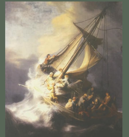
لوحة «العاصفة على بحر الجليل» لرامبرانت أكبر صورة سرقت (متحف بوسطن)

وقد اتضح أن أحداث السرقة ينطوي على كثر دفين من الحقائق المدهشة، والتقلبات غير المتوقعة في الحكاية. وفيما يلي خمسة أشياء تجعل متحف إيزابيلا ستيوارت غاردنر وحادث السرقة الشهير الذي تعرض له، مثيرين للغاية. الحقيقة تعد إيزابيلا ستيوارت غاردنر، مؤسسة المتحف والتي تحمل الاسم نفسه، شخصية رائعة. كانت غاردنر، الابنة والأرملة في نهاية المطاف لاثنتين من رجال الأعمال الناجحين، من محبي الأعمال الخيرية، وجامعي الأعمال الفنية، وأنشأت هذا المتحف لعرض مقتنياتها. وتقدر قيمة الأعمال الفنية التي نهبها اللصوص بأكثر من نصف مليار دولار. ومع ذلك، تركوا وراءهم أعلى قطعة أثرية في المبنى: لوحة