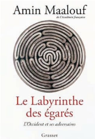
«متاهة التائهين» للأمين معلوف

بدأ من تلك اللحظة انطلقت النهضة اليابانية بسرعة صاروخية إلى حد أنها أدهشت البشرية بأسرها. فلأول مرة استطاعت أمة شرقية أن تكسر احتكار الغرب للسيطرة على العلم والحضارة والتكنولوجيا. من المعلوم أن أصولية الغرب على العالم كانت قد أصبحت كاملة شاملة منذ القرن السادس عشر وحتى القرن التاسع عشر والعشرين. وكانت هيمنة شبه مطلقة على كافة الأصعدة والمستويات: من علمية وفلسفية وحضارية وتكنولوجية. ويعود الفضل في ذلك إلى عصر التنوير الكبير في القرن