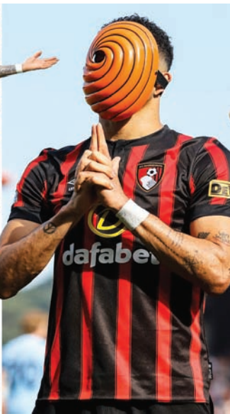
من اليمين: مورغان غيبس وفاييان شار ودومينيك سولانكي وروس باركلي وأنتوني روبنسون