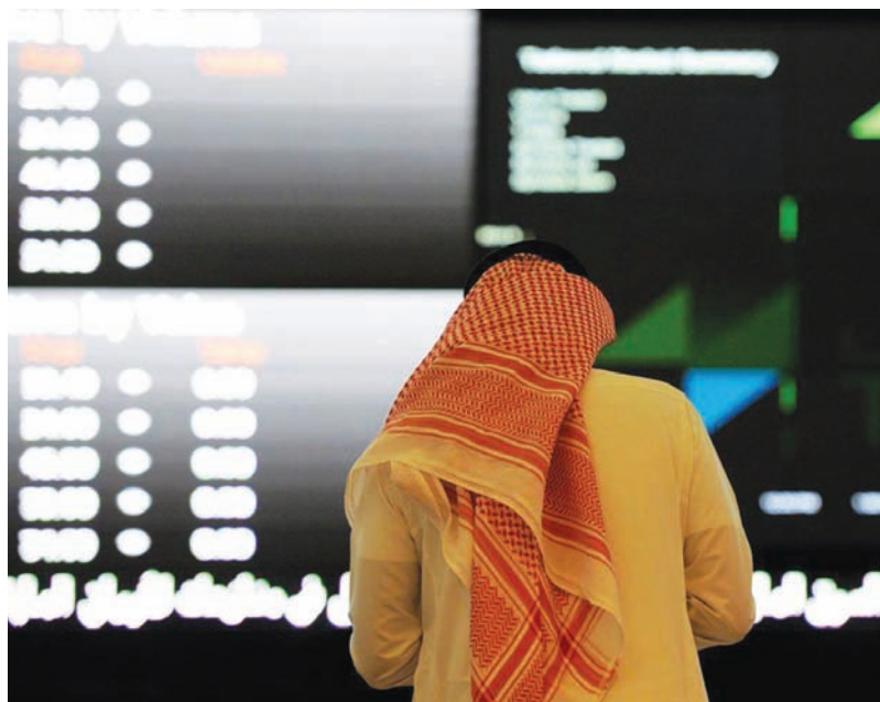
توقعات بتجاوز الأرباح المجمعة للقطاع 980 مليون ريال خلال الربع الثاني (أ.ف.ب)

ويتوقع الفراج استمرار وتيرة النمو، خلال العام الحالي، لتتجاوز الأرباح المجمعة للقطاع 980 مليون ريال (261 مليون دولار) خلال الربع الثاني، و3,9 مليار ريال (نحو مليار دولار) بنهاية 2024؛ نتيجة استمرار التحسن في الاقتصاد السعودي، وارتفاع الوعي بأهمية التأمين، وطرح منتجات تأمينية جديدة تلبي احتياجات العملاء، ودخول شركات جديدة السوق. وأبان الفراج أنه على الرغم من هذه النظرة الإيجابية، فإن قطاع التأمين السعودي يواجه بعض التحديات، مثل المنافسة الشديدة بين شركات التأمين، وارتفاع تكلفة الالتزامات، وانخفاض أسعار الفائدة المستقبلية، والتغيرات في الأنظمة واللوائح التنظيمية.