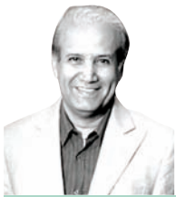
عبد الرحمن الراشد

لا تشبه العاصمة اليابانية في انسيابية الحركة والطرق والناس أي عاصمة مكتظة بالسكان