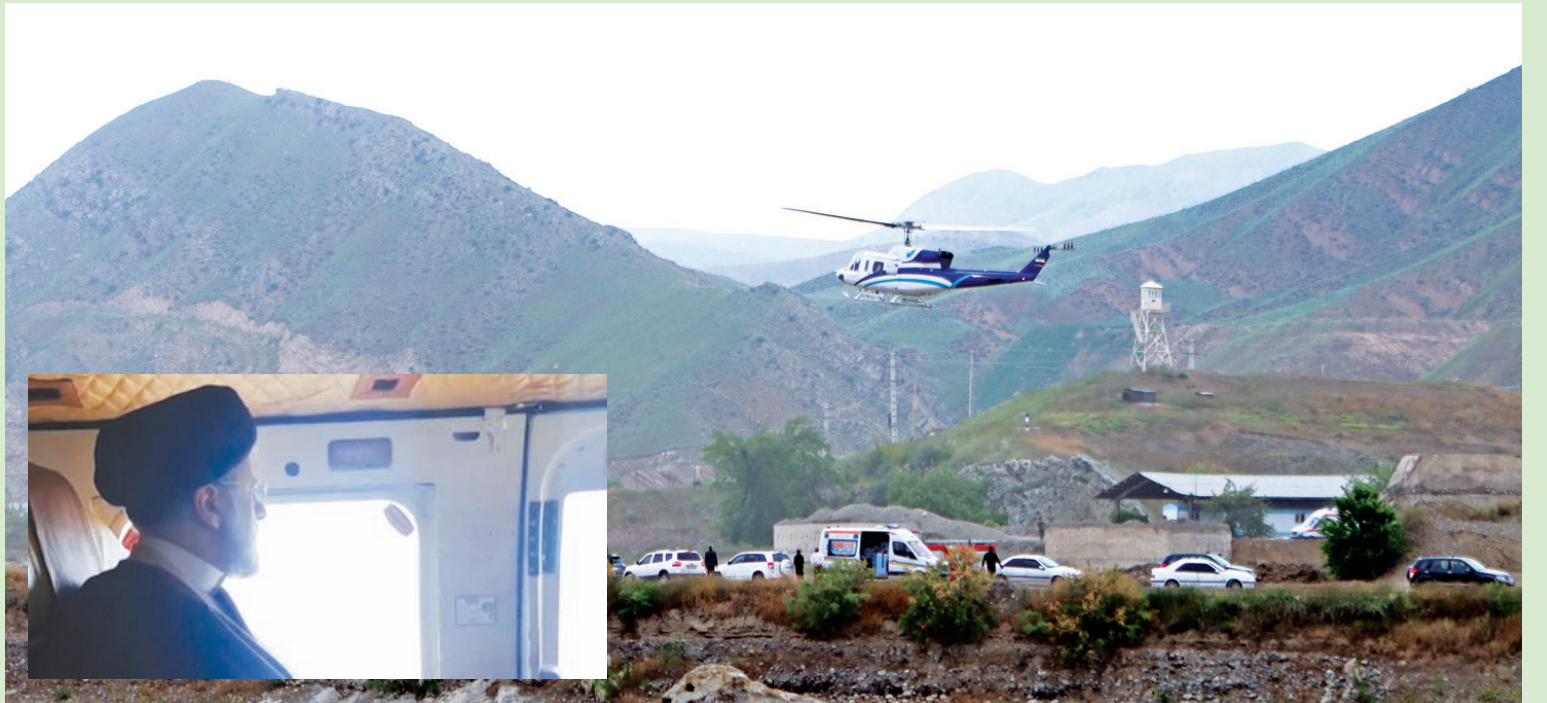
صورة وزعتها وكالة «إرنا» للمروحية بعد إقلاعها، وفي الإطار رئيسي على متنها قبل الإقلاع (إ.ب.أ / أ.ف.ب)

على هذه الأنباء، فيما تحدث التلفزيون الرسمي عن اتصال مع شخصين كانا على متن المروحية، لكن لم يؤكد الخبر لاحقاً. وتقلت وكالة «رويترز» عن مسؤول إيراني قوله إن مروحية الرئيس سقطت أثناء تحليقها عبر منطقة جبلية يحيط بها ضباب كثيف. وذكر المسؤول، الذي تحدث شريطة عدم كشف هويته، أن حياة رئيسي وعبداللهيان «في خطر». وأضاف: «ما زال بحدونا الأمل، لكن المعلومات الواردة من موقع التحطم مقلقة للغاية».