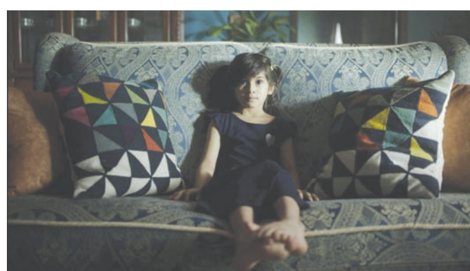
مشهد من فيلم «أحلام العصر»

حكيم جمعة هو طبيب، واليوم نراه ممثلاً بامتياز، وقليل هم من يعرفون هذه المعلومة، فيما تعلق على الأمر؟ «استطيع القول اليوم، إنني مارست مهنة الفن أكثر من الطب. فبعد تخرجي عملت طبيباً 4 سنوات، ودخلت بعدها الساحة الفنية، لأرى نفسي اليوم فناناً من الدرجة الأولى»، ويؤكد أن ما جعله يتفرغ للفن تلك البوادر المشجعة التي طالت حراك السينما السعودية، فقرر أن يكون جزءاً منه.