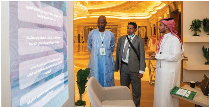
يعد المرصد أول منصة عربية متقدمة لخدمة المترجمين والباحثين والناشرين (هيئة الأدب)

في الاستفادة من هذه المكنات الكبيرة التي تهمد لصناعة ترجمة جادة وفاعلة في ظل حوكمة جيدة وسوق رابحة ومنظومة تبدأ من المؤلف والكلاء الأدبيين والمترجم ودور النشر، انتهاءً بالقارئ العربي الذي ينعم بمرحلة ثقافية نوعية ومبشرة.