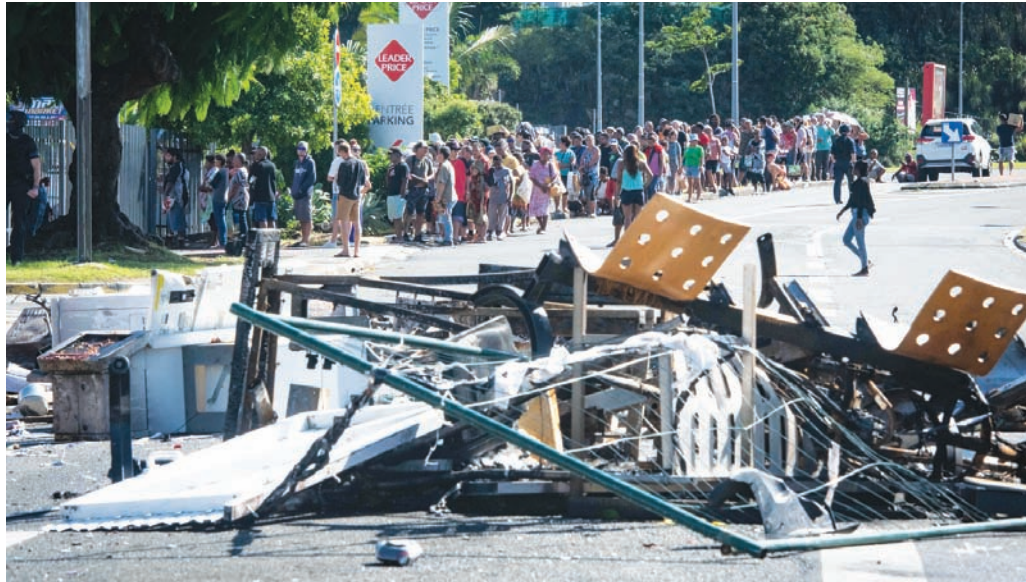
الحواجز ما زالت قائمة على الطرقات وتمنع التنقل الحر بين أحياء نومييا (أ.ف.ب)

بيد أن هذه الدعوة، التي تتوافق مع ما يدعو إليه اليسار والخضر في فرنسا،