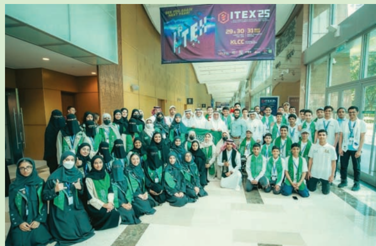
تتفوق المواهب السعودية يعكس المكانة المتقدمة للمملكة (واس)

ويأتي الإنجاز، ليُترجم الجهود المشتركة للمؤسسات التعليمية والخاصة التي تقودها وزارة التعليم بالتعاون مع مؤسسة الملك عبد العزيز ورجاله للموهبة والإبداع «موهبة»، وأكاديمية طويق ومدارس مسك، لتأهيل الطلبة وتنمية مواهبهم وقدراتهم؛ ليواصلوا تمثيل المملكة في المحافل الدولية والعالمية بشكل مُتميز يعكس ما تحظى به المملكة من مكانة رائدة ومُتقدمة في مجالات العلوم