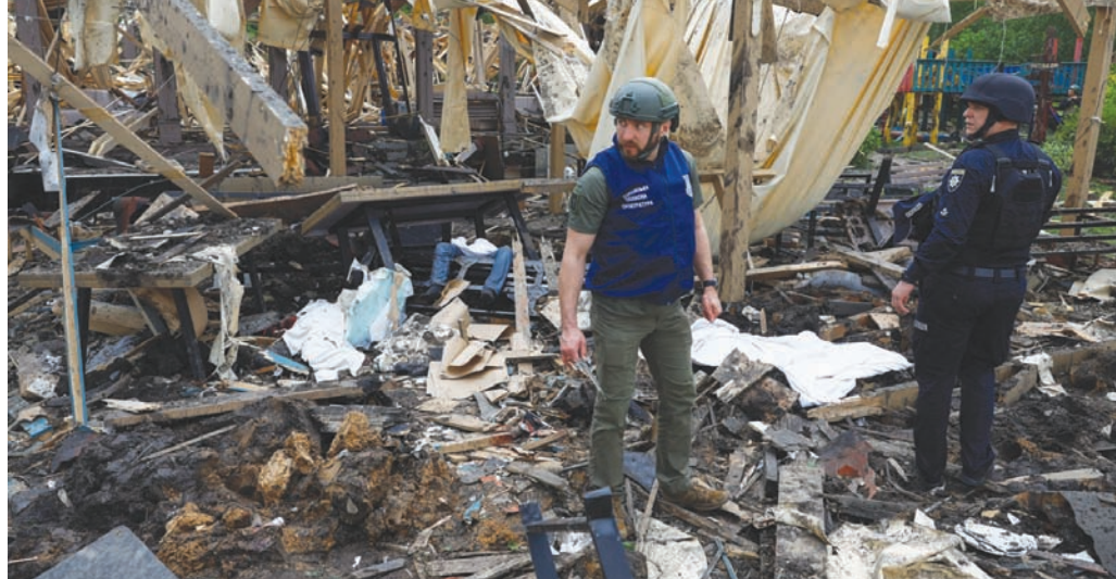
تسبب القصف الروسي لخاركيف في قتل 4 أشخاص على الأقل أمس

ساعات على توجيه زيلينسكي انتقادات لحلفائه الغربيين. وقال: «يمكنهم (الروس) ضربنا انطلاقاً من أراضيهم، وهذا أكبر تفوق تتمتع به روسيا، ولا يمكن لنا أن نفعل أي شيء لأنظمة أسلحتهم الموجودة على الأراضي الروسية باستخدام الأسلحة الغربية. ليس لدينا الحق في القيام بذلك»، مؤكداً أنه اشتكى من ذلك مجدداً، هذا الأسبوع، إلى وزير الخارجية الأميركي أنتوني بلينكن.