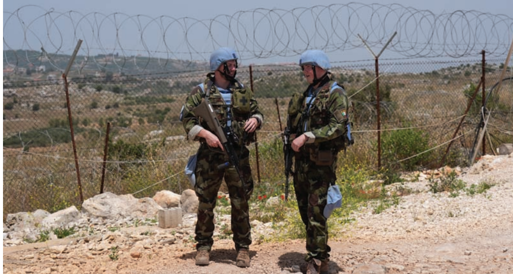
جنديان من «يونيفيل» على الحدود اللبنانية-الإسرائيلية

تجددت التهديدات الإسرائيلية باجتياح جنوب لبنان، «في حال لم يستجيب (حزب الله) للإنداز الأخير»، وذلك في أعقاب الكشف عن رسائل إسرائيلية إلى الولايات المتحدة ولبنان عبرت فيها عن أن «صبرها ينفذ»، وفق ما ذكرت وسائل إعلام إسرائيلية، وسط تبادل متواصل لإطلاق النار على ضفتي الحدود في جنوب لبنان. ونقلت صحيفة «هآرتس» الإسرائيلية، الأحد، عن وزير المالية الإسرائيلي، بتسلئيل سموتريتش، قوله إنه «سيتعين على الجيش السيطرة على جنوب لبنان، إذا لم يستجيب (حزب الله) للإنداز الأخير». وقال الوزير الإسرائيلي، في مؤتمر صحافي بشمال إسرائيل: «لكي يعود سكان الشمال إلى واقع أمني مختلف ويستمتعوا بنوم هادئ ليلاً، يجب أن تنتهي هذه الحرب بهزيمة عسكرية حاسمة لـ (حزب الله)». وأضاف أنه يتعين «إنشاء منطقة أمنية يبقى فيها الجيش الإسرائيلي في جنوب لبنان»، وتوجيه إنذار نهائي لـ «حزب الله» بشأن سكان الشمال، في حين نقلت القناة 12 عنه قوله: «إننا في طريقنا إلى الحرب مع (حزب الله)، هي أمر لا مفر منه». من جهة أخرى، نقلت صحيفة «معاريف» عن مصادر عسكرية قولها إن الجيش الإسرائيلي جاهز لشن هجمات ضد (حزب الله)، وقالت المصادر للصحيفة