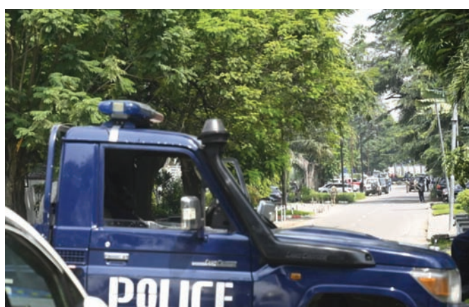
سيارات شرطة وآليات عسكرية تغلق أحد شوارع كينشاسا صباح أمس