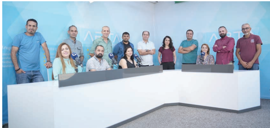
فريق عمل إذاعة «آرتا» (الشرق الأوسط)