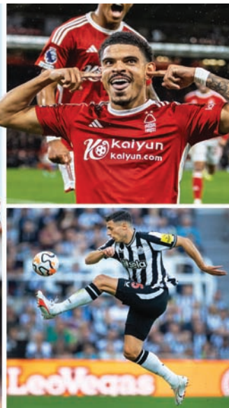
من اليمين: مورغان غيبس وفاييان شار ودومينيك سولانكي وروس باركلي وأنتوني روبنسون

تاركوفسكي دوراً حاسماً مع الفريق هذا الموسم، بفضل وجوده في المكان المناسب في الوقت المناسب.