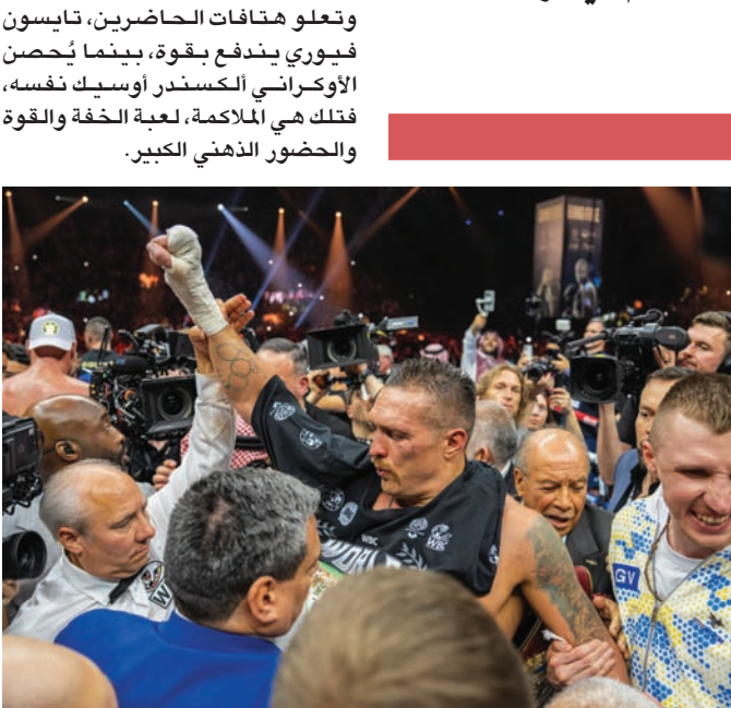
أوسيك يحتفل مع أنصاره بالفوز الكبير (موسم الرياض)