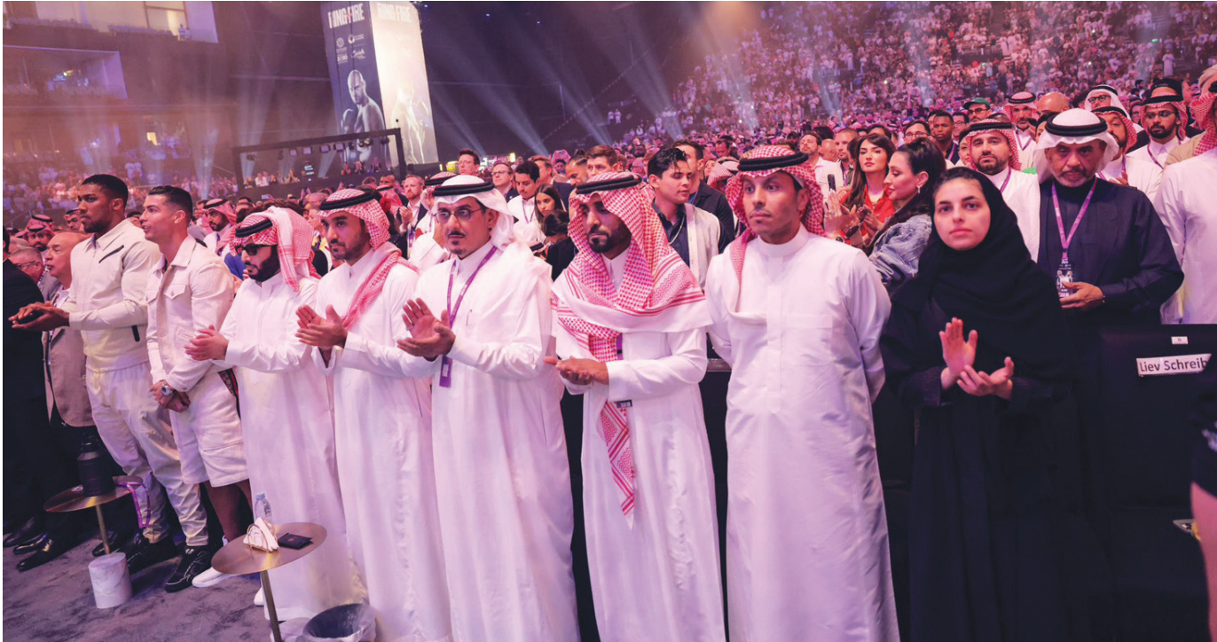
تركي آل الشيخ والفيصل وشيهاة العزاز ورونالدو كانوا في مقدمة كبار الحاضرين للنزال (موسم الرياض)

عُرفت الرياض عاصمة السعودية بهدوء ليلها ورقعتها، رغم اكتظاظ الحراك في شوارعها الذي لا يهدأ، فهي قلب نابض بالحياة والحراك، وظلت رائعة الراحل الأمير بدر عبد المحسن حينما كتب «أه ما أرق الرياض تالي الليل» أيقونة لليل العاصمة السعودية وعلامة تميزه وجماله. إلا أن الساعات الأولى من فجر يوم الأحد، وتحديداً في «المملكة أرينا» بالحلبة التي شهدت نزال النار، كانت عكس ذلك تماماً، حيث المواجهة المثيرة بين البريطاني تايسون فيوري، والأوكراني الكسندر أوسيك، ومشاهير الرياضة والفن يجلسون مطوقين الحلبة في انتظار موقعة تاريخية لا تتكرر كثيراً. تقدم الأمير عبد العزيز بن تركي الفيصل وزير الرياضة في السعودية، والمستشار تركي آل الشيخ رئيس الهيئة العامة للترفيه، وشيهاة العزاز رئيس مجلس إدارة الهيئة الفكرية السعودية، الحضور في «المملكة أرينا»، الذي شهد توافد نجوم الرياضة والفن وعدد من الشخصيات، من بينها إنزيرولو الرئيس التنفيذي لبوابة الدرعية، ونجوم الدوري السعودي، يتقدمهم البرتغالي الشهير كريستيانو رونالدو، والنجم البرازيلي نيمار، والإنجليزي ستيفن جيرارد أيقونة ليفربول الإنجليزي ومدرب الاتفاق الحالي، وكذلك الملاكم البريطاني جوشوا، والمقاتلة السعودية هتان السيف. بدأ التوافد الجماهيري منذ ساعات مبكرة من عصر يوم السبت لمشاهدة النزال الجانبية التي تسبق النزال الرئيس والمرتب، جماهير سعودية عشقت الملاكمة وبانت تحضر في مدرجاتها بسهولة دون عناء، وأخرى حضرت من أقطاب العالم خصيصاً لهذا النزال الكبير. وبالنقاط وبفارق ضئيل جداً فاز الملاكم الأوكراني الكسندر أوسيك على البريطاني تايسون فيوري ليتوج بطلاً للعالم لوزن الثقل بلا منازع في نزال مثير أقيم في العاصمة السعودية في الساعات الأولى من صباح أمس (الأحد).