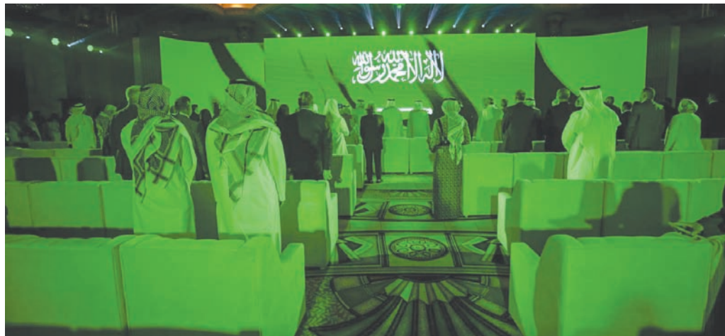
دُشن المرصد بحضور عدد من المسؤولين والمعتنين بالشأن الثقافي (هيئة الأدب)

تنضم المبادرة إلى قائمة الأعمال التي أسفر عنها الدور السعودي في منظمة «الألكسو»