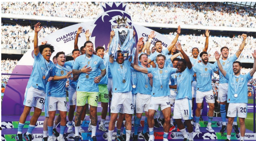
لاعبو سيتي على منصة التتويج يحتفلون بكأس الدوري الممتاز

طرد البرتغالي نيلسون سيميديو في الدقيقة 28. ولم تكن نهاية الموسم كما تمنّاهما جمهور ليفربول، ليس بسبب الاكتفاء بالمركز الثالث فقط، بل لأنه ودّع كلوب الذي صدم الجميع في يناير (كانون الثاني) بقرار الرحيل قبل عامين على انتهاء عقده، منهيًا حقبة رائعة قاد بها النادي عام 2020 إلى لقبهم الأول في الدوري منذ 1990 وإلى الفوز بلقب دوري أبطال عام 2019، إضافة إلى إحصائه للنهائي عامي 2018 و2022 وإحراز كل من الكأس والكأس السوبر الأوروبية وكأس العالم للنادية مرة واحدة وكأس الرابطة المحلية مرتين.