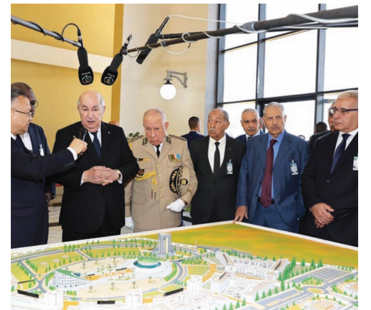
الرئيس تبون مع كبار المسؤولين المدنيين والعسكريين في القطب العلمي بالعاصمة

وعبر تبون عن يقينه بـ«إعلاء الجزائر أعلى المراتب، بفضل طاقاتها الشبابية وبفضل طلاب الجامعات»، الذين وعدهم بعد أن استمع إلى إنشغالهم بخصوص التوظيف بعد التخرج، بأن الدولة «مستعدة لتمويل كل المشروعات