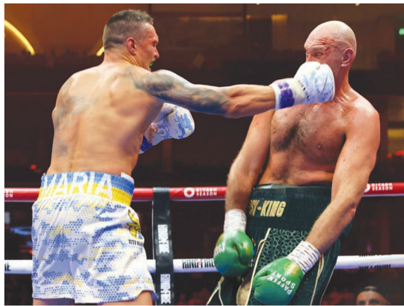
لكمة قاضية وجهها أوسيك لوجه فيوري (أ.ف.ب)

وذكرت «رويترز»، أمس، أنه ربما لا يستمر الملاكم الأوكراني الكسندر أوسيك بطلاً للعالم لوزن الثقل بلا منازع سوى لأسابيع قليلة فقط، إذا ما أقدم الاتحاد الدولي للملاكمة كما يتوقع كثيرون على استرداد الحزام الخاص به بسبب وجود بند في العقد ينص على إقامة مباراة إعادة في مواجهة المنافس البريطاني تايسون فيوري. والمتحدي التالي على قائمة الاتحاد الدولي للملاكمة هو الملاكم الكرواتي الذي لم يهزم فيليب هرجوفيتش، الذي من المقرر أن يواجه البريطاني دانييل دوبوا في أول يونيو (حزيران) المقبل في العاصمة السعودية. وهذه المواجهة ربما تصبح مباراة على لقب الاتحاد الدولي للملاكمة إذا ما أُنبح الإتحاد الدولي، ومقره الولايات المتحدة، الخطوات السابقة، ومن ثم يرشح الفائز لمواجهة البطل السابق البريطاني أنتوني جوشوا في وقت لاحق من العام الحالي. وكان الاتحاد الدولي للملاكمة جرد فيوري من الحزام في ديسمبر (كانون الأول) 2015 بعد 10 أيام من انتزاعه اللقب إلى جانب القاب الرابطة العالمية للملاكمة والمنظمة العالمية للملاكمة والمنظمة الدولية للملاكمة من الأوكراني فلاديمير كليتشكو. وفي هذا الوقت، كان هناك بند ينص على تنظيم مباراة إعادة، كما الحال الآن، واتصلت «رويترز» بالاتحاد الدولي للملاكمة للتعليق، لكنها لم تحصل على رد فوري. وبعد مباراة توحيد اللقب في وقت مبكر من أمس (الأحد)، قال أوسيك إنه ملتزم ببند مباراة إعادة، بينما أوضح فيوري أنه يتوقع المواجهة.