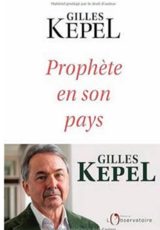
«نبي في وطنه» لجيل كيبل

الثامن عشر وظهور الثورة الصناعية الإنجليزية التي كانت أكبر حدث في تاريخ البشرية كما يقول أمين معلوف. فقد ازدهرت عندئذ العلوم والتقنيات والأفكار بشكل هائل لا مثيل له في أوروبا الغربية أولاً، ثم أميركا الشمالية ثانياً. وهذا هو الغرب بالمعنى الواسع للكلمة؛ إنه أوروبا زائد أميركا. وأميركا هي بنت أوروبا كما كان يقول الجنرال ديغول. وأدى ذلك إلى تشكيل أكبر حضارة في تاريخ البشرية على يد الثورة الإنجليزية المجيدة عام 1688، والثورة الأميركية عام 1776، ثم بالأمس الثورة الفرنسية الكبرى عام 1789. كل ذلك أدى إلى انتصار قيم عصر الأنوار على قيم الظلامية المسيحية والأصولية الكاثوليكية البابوية. ثم جاءت اليابان في أواخر القرن التاسع عشر لكي تلحق بالغرب وتنضم إلى ركب الحضارة والتقدم والرقي. وينبغي التوقف هنا قليلاً عند كلمات الإمبراطور الياباني المستنير المدعو بالميجي. فهذه الكلمات القلائل هي التي أشعلت نهضة اليابان ودشنها. ماذا تعني في نهاية