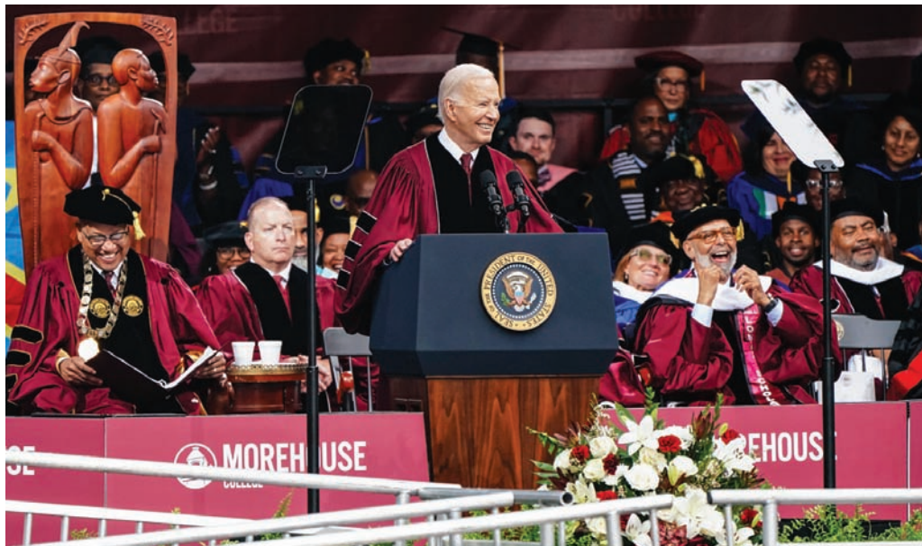
الرئيس الأميركي جو بايدن يلقى خطاب التخرج في كلية مورهاوس في أتلانتا بولاية جورجيا أمس

وقام عدد من طلبة كلية مورهاوس برفع العلم الفلسطيني، بينما كان بايدن يتحدث، كما قام البعض الآخر بإدارة ظهورهم للرئيس أثناء إلقائه خطاب التخرج. تأتي كلمة بايدن بينما كان مستشار الأمن القومي الأميركي جيك سوليفان يعقد اجتماعاته مع بنيامين نتانياهو رئيس الوزراء، وساحي هانغبي مستشار الأمن القومي الإسرائيلي، وكبار المسؤولين الحكوميين في تل أبيب، حيث تستهدف نقاشات سوليفان الحصول على رؤية واضحة لخطة نتانياهو، فيما يتعلق