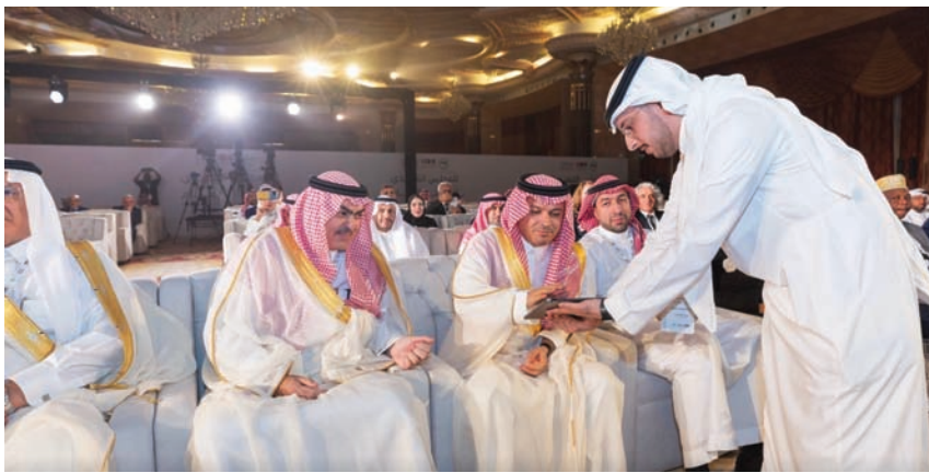
دشنت الهيئة المرصد العربي للترجمة وأطلقت أعماله (هيئة الأدب)

وجرى تدشين المرصد وبدء أعماله، بحضور عدد من المسؤولين والمعتنين بالشأن الثقافي من مختلف دول العالم العربي، وذلك على هامش المؤتمر العام لـ«الألكسو» الذي استضافته مدينة جدة، وجرى بنهايته انتخاب ممثل السعودية لرئاسة المجلس التنفيذي للمنظمة العربية