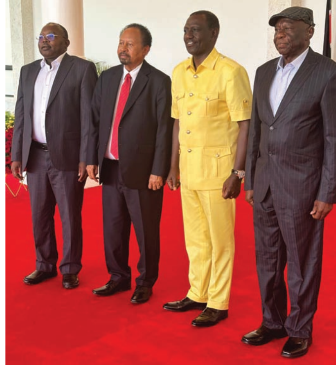
الرئيس الكيني يتوسط الموقعين على الاتفاق (الشرق الأوسط)

الفترة الانتقالية. من جهته، أشاد الرئيس الكيني ويليام روتو الذي رعى الاتفاق بموقفي «إعلان نيروبي»، ودعاهم «للمعمل» لبدء عملية السلام في البلاد، وأكد على دور بلاده بصفتها «شريكة رئيسية في جهود تحقيق السلام في السودان»، ودعا المجتمع المدني والجماعات المنظمة الأخرى للمشاركة في الإعلان من أجل تحقيق السلام، وتكوين حكومة مدنية