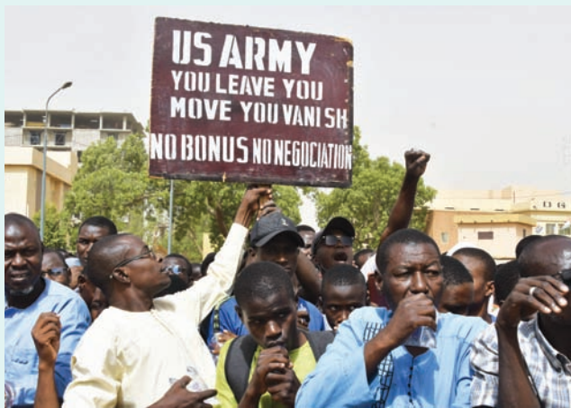
لافتة تطالب الجنود الأميركيين بمغادرة النيجر بلا تفاوض خلال مظاهرة في نيامي أبريل الماضي

الأميركيين خلال عملية الانسحاب. وجاء في البيان المشترك أن «وزارة دفاع النيجر ووزارة الدفاع الأميركية تعترزان بالتضحيات المشتركة لقوات الحرب على الإرهاب، وترحبان بالجهود المشتركة المبذولة في بناء القوات المسلحة في النيجر». وأضاف أن: «انسحاب القوات الأميركية من النيجر لا يؤثر بآية حال من الأحوال في مواصلة العلاقات بين الولايات المتحدة والنيجر في مجال التنمية. كما أن البلدين ملتزمان بحوار دبلوماسي مستمر لتحديد مستقبل علاقاتهما الثنائية».