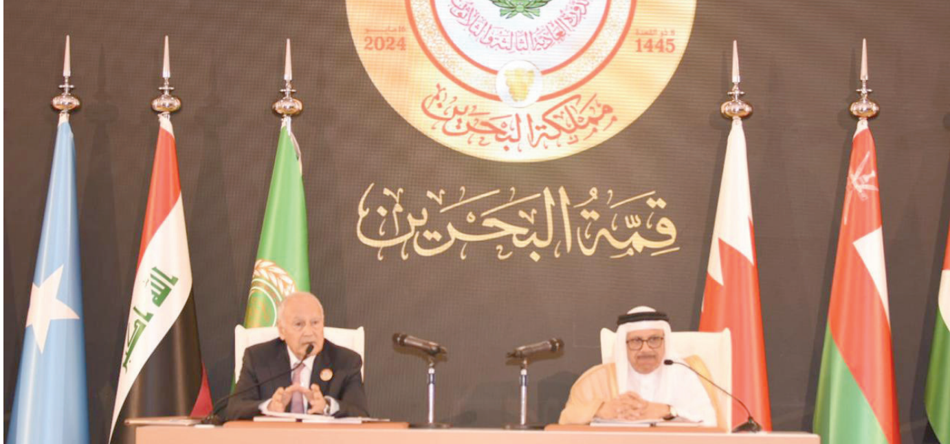
مؤتمر صحافي مشترك للأمين العام لجامعة الدول العربية أحمد أبو الغيط ووزير الخارجية البحريني عبد اللطيف الزياني

وأشار أبو الغيط إلى أن مؤتمر القاهرة للسلام في 23 أكتوبر (تشرين الأول) الماضي «كشفت عن توجه دولي لوقف إطلاق النار والهدنة وتحقيق الاستقرار في قطاع غزة»، وتابع أبو الغيط، «أن ما حدث في