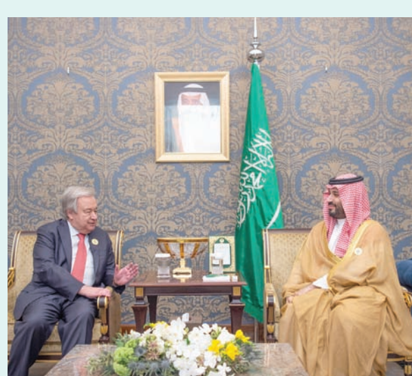
... ومجتمعاً مع الأمين العام للأمم المتحدة أنطونيو غوتيريش