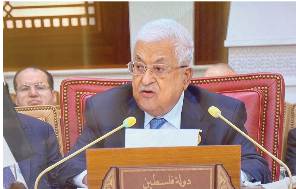
الرئيس الفلسطيني محمود عباس خلال كلمته في قمة البحرين

وفي الضفة الغربية والقدس، «واصلت دولة الاحتلال اعتداءاتها على شعبنا وأرضه ومقدساته الدينية، من خلال جيشها ومستوطناتها الإرهابية، متسائلاً في الوقت نفسه: «إلى متى سيستمر كل هذا الإرهاب الإسرائيلي؟ ومتى تنتهي هذه المأساة، ويتحرر