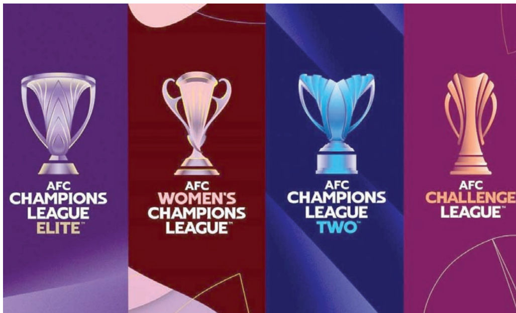
الاتحاد الآسيوي أعلن عن الهوية الجديدة لبطولاته خلال اجتماع الجمعية العمومية

إلى ذلك، حصلت أستراليا وماليزيا على مقعد مباشر واحد لكل دولة. وسيضم دوري أبطال آسيا للنخبة أفضل 24 نادياً في القارة، بينما من المقرر أن يضم دوري أبطال آسيا للسيدات 12 نادياً، ويضم «دوري أبطال آسيا 2» مشاركة 32 نادياً، في حين يتنافس 20 فريقاً في دوري التحدي الآسيوي.