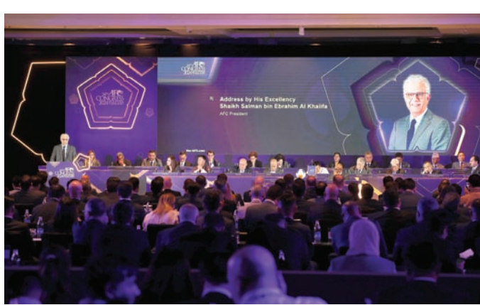
من اجتماعات الاتحاد الآسيوي في بانكوك (إ.ب.أ)

ويعد هذا الإلغاء الطريق لرئيس الاتحاد الشيخ البحريني سلمان آل خليفة، الذي يخوض حالياً ولايته الثالثة، لإعادة انتخابه في 2027.