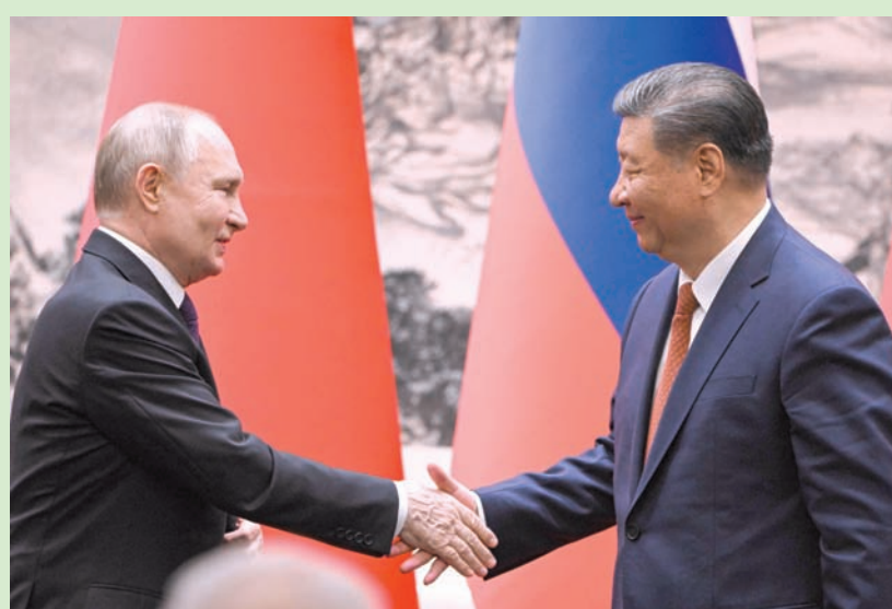
الرئيس الروسي والصيني خلال اجتماعهما في بكين أمس

رفض رئيس الاتحاد الدولي لكرة القدم «فيفا» جيانى إنفانتينو، التجاوب مع طلب الاتحاد الفلسطيني لكرة بتعليق عضوية إسرائيل، بسبب الحرب على غزة، وتنظيم تصويت على هذا التعليق، خلال مؤتمر المقرر في بانكوك اليوم. وقال إنفانتينو: «كل ما يمكننا فعله هو إظهار الوحدة، لأن كرة القدم هي ما توحد الجميع». وكان رئيس الاتحاد الآسيوي لكرة القدم، الشيخ سلمان آل خليفة، قد عبر أمس (الخميس) عن دعمه لاقتراح الاتحاد الفلسطيني، قائلاً «نقف بجانب الاتحاد الفلسطيني». (تفاصيل ص 20)