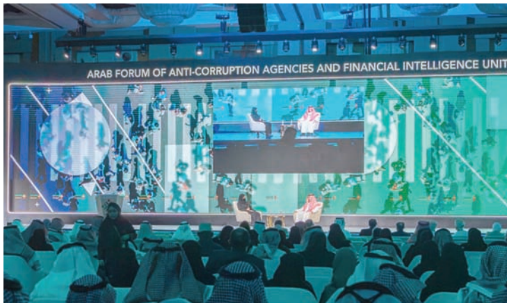
جانب من «الملتقى العربي لهيئات مكافحة الفساد ووكالات التحريات المالية» (كس)

وأبان أن الجهات الإشرافية والرقابية على القطاع المالي في المملكة، وفُرت التدريب المتخصص للعاملين في المؤسسات الخاضعة لها، لتمكّنهم من استخدام الحلول التقنية في عمليات الكشف عن الجريمة.