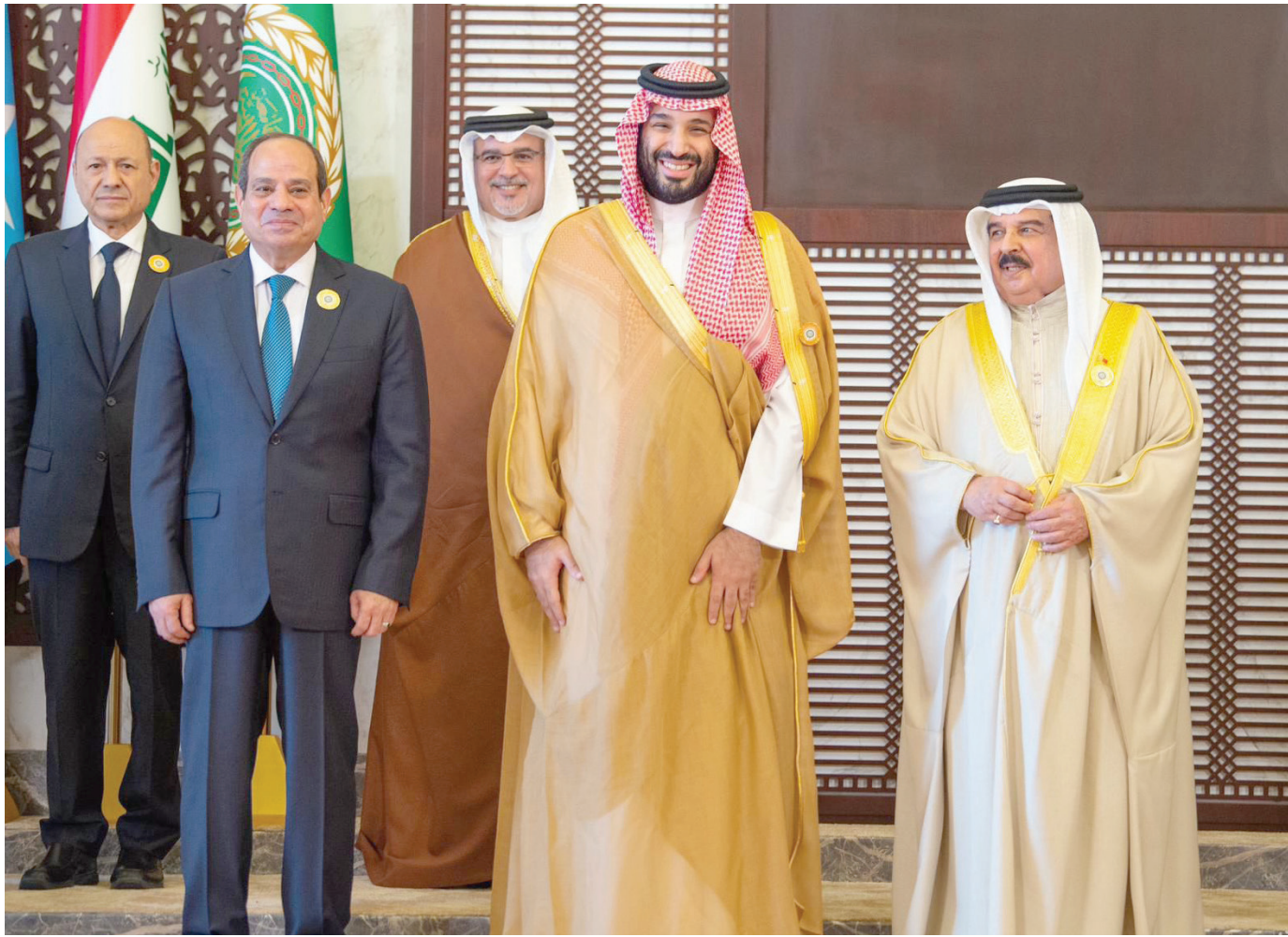
ولي العهد السعودي يتوسط الملك البحريني والرئيس المصري

وقال ولي العهد السعودي: «نحن على ثقة بأن ما تشهده المنطقة العربية من تحديات سياسية وأمنية لن يحول دون استمرار جهودنا المشتركة لمواجهة هذه التحديات والمضي قدماً لمواصلة مسيرة التطور والتنمية المستدامة بما يعود بالرخاء والأزدهار لدولنا العربية وبحق أمهالها وتطلعاتها». واحتتم ولي العهد السعودي كلمته، مهتماً الملك حمد بن عيسى بـ«مسؤولية توليه رئاسة الدورة الثالثة والثلاثين للقمة العربية، سائلين المولى عز وجل أن يوفقه ويعينه في أداء هذه المهمة»، ثم سلم رئاسة الدورة العادية الثالثة والثلاثين لمجلس جامعة الدول العربية على مستوى القمة إلى ملكة البحرين.