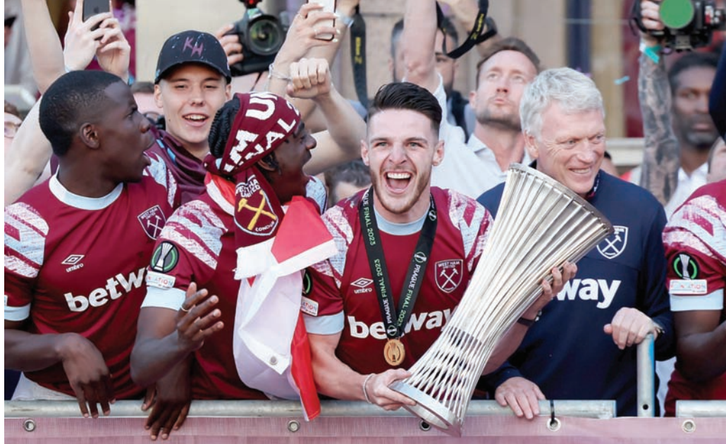
مويز قاد وست هام الموسم الماضي للحصول على أول بطولة كبرى له منذ 43 عاماً

مايكل أنطونيو لأربعة أهداف في مرمى نوريتش سيتي بوصفها ذكراً جميلة، كما تحدث عن حصول وست هام على المركز السادس بفوزه على ساوثهامبتون عندما عادت الجماهير للملاعب في عام 2021. لقد صعد وست هام إلى منصة التتويج الأوروبي تحت قيادة مويز، الذي رأى أستون فيلا وهو يفشل في تكرار إنجازاته السادس للفوز بدوري المؤتمر الأوروبي. وكان ملعب لندن يهتز من حماس الجماهير عندما فاز وست هام على إشبيلية بقيادة لوبيتيغي في دور الستة عشر من بطولة الدوري الأوروبي في عام 2022. وواصل وست هام تحدي الصعاب وفاز بثلاثية نظيفة على ليون في الجولة التالية.