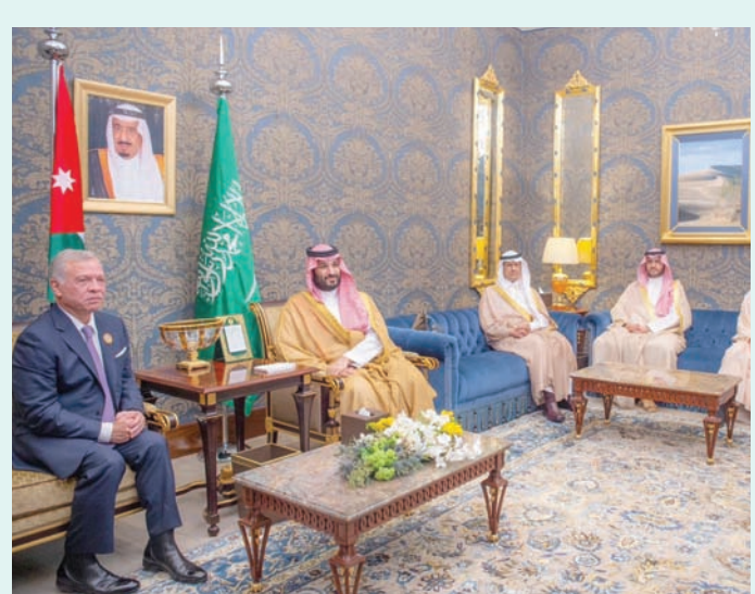
مباحثات ولي العهد السعودي الأمير محمد بن سلمان مع العاهل الأردني الملك عبد الله الثاني