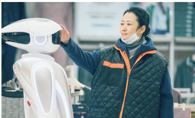
«حبيسة المد» (MK2)

إذا فاز كوبولا في هذه الدورة فسيكون الأول والوحيد بين كل مخرجي العالم الذي فاز بالسعفة ثلاث مرات.