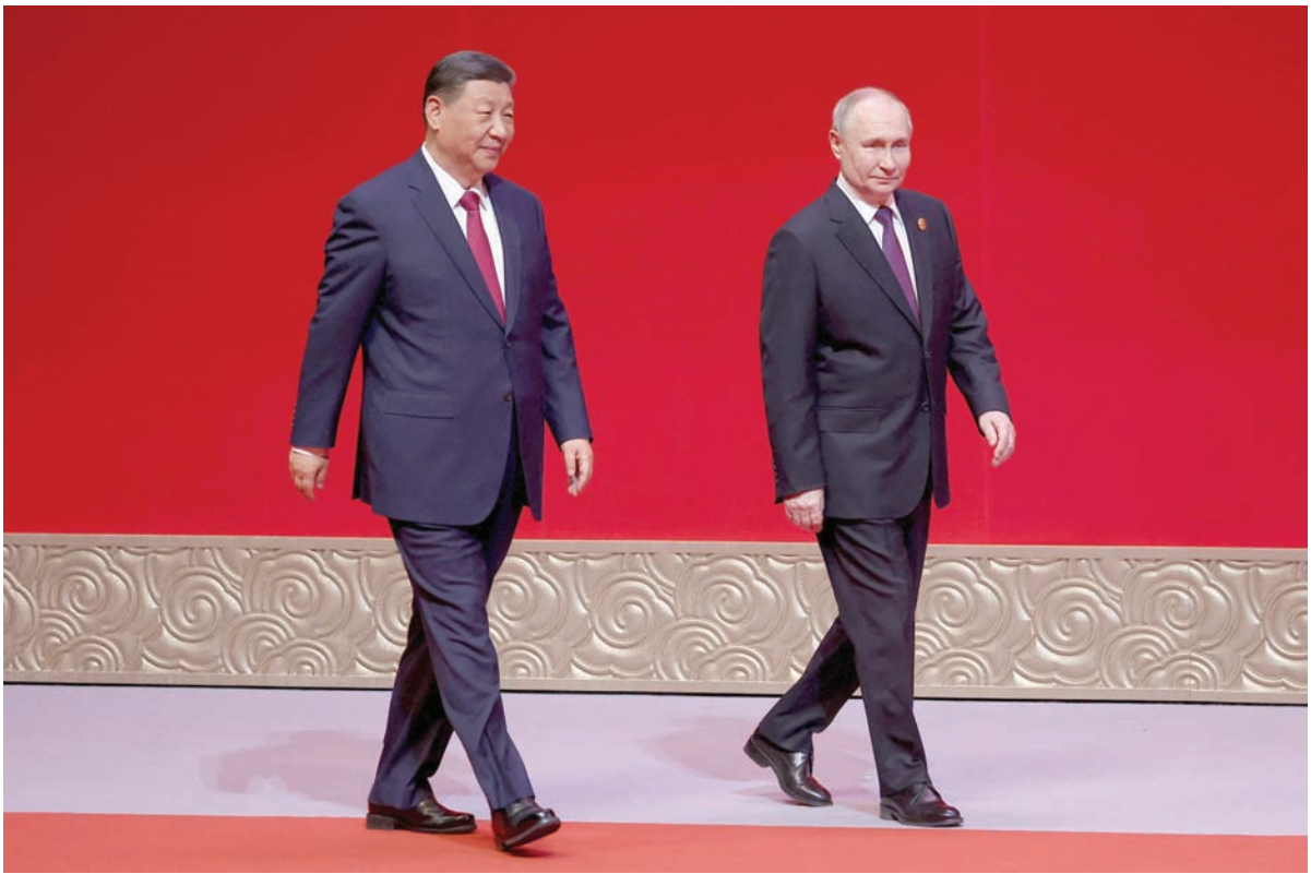
الرئيس الروسي فلاديمير بوتين ونظيره الصيني شي جينبينغ في الذكرى الـ75 لتأسيس علاقات دبلوماسية بين البلدين