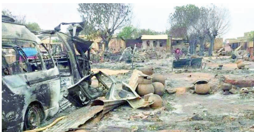
آثار الحرب المدمرة في الفاشر حاضرة شمال دارفور

المعلومات بين أجهزتنا والأجهزة التي تجمع تلك الشهادات».