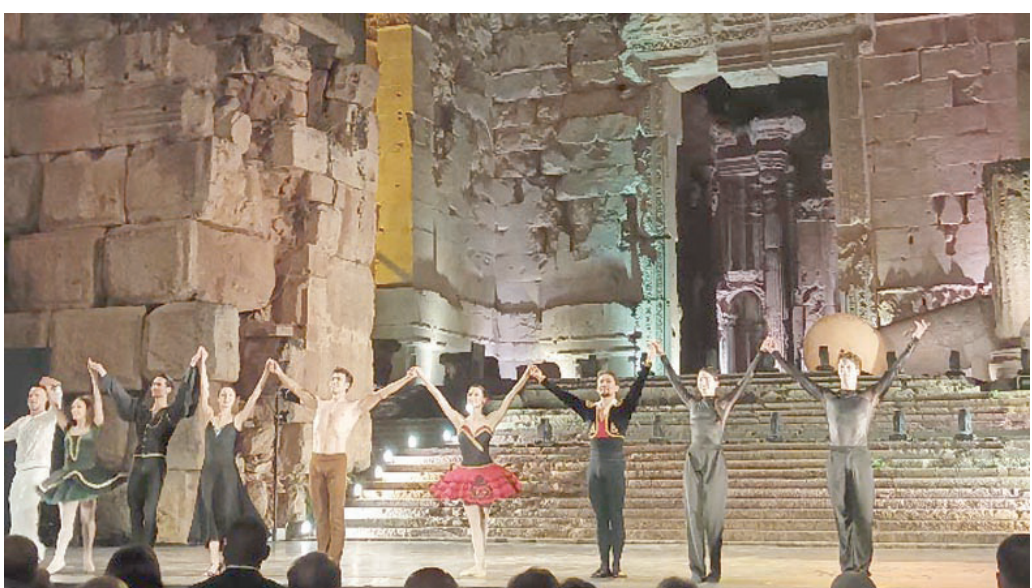
من حفلات مهرجانات بعلبك

وتعيشه فلسطين من حال إبادة جماعية متواصلة على مرأى العالم وصمته». وأشارت إلى أن «لجنة مهرجانات بيت الدين إذ تدرك أن جمهورها سيكون متفهماً لقرار تعليق المهرجان، وإيماناً منها بضرورة الاستمرار في مواصلة الدور الثقافي، خصرت النشاطات في معارض للفنون تقام في باحات القصر خلال فصل الصيف». وأملت نورا جنبلاط أن «يستعيد الجنوب اللبناني الهدوء والاستقرار، وأن تحوّل الحرب في غزة وتعود فلسطين». متطلعة إلى أن «تتحسن الظروف العامة لمواصلة الدور الفني والثقافي الذي لعبته المهرجانات بشكل متواصل منذ عام 1984 إيماناً منها بدور لبنان ورسالته».