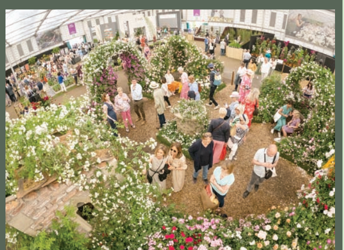
معرض الزهور أعاد الإحساس بالجدوى