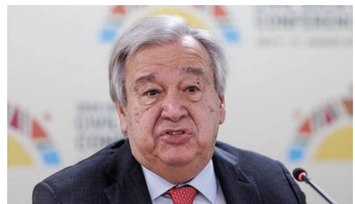
الأمين العام للأمم المتحدة أنطونيو غوتيريش

وأوضح غوتيريش، خلال الجلسة الافتتاحية للقمة العربية الثالثة والثلاثين في البحرين (الخميس)، أن المنطقة العربية يمكنها الاستفادة من إمكاناتها الهائلة، والمساهمة بشكل أكبر في تحقيق الخير للعالم.