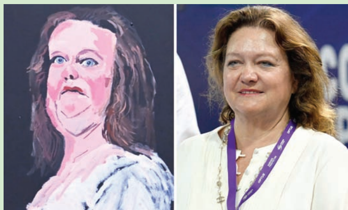
سيدة اللوحة الفنانة

معرضة للجمهور في مدينة أدلبايد لأشهر، كما وضعت أيضاً في كتاب أصدرته دار نشر «تابمز وهسون» المرموقة، يجمع أعمال الفنان ناماتغيرا كافة.