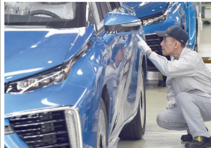
عامل يفحص سيارة في أحد مصانع شركة «تويوتا» اليابانية

تراهن شركات صناعة السيارات اليابانية الكبرى على التعاون مع إمبراطوريات التكنولوجيا المتقدمة الصينية في محاولة لاستعادة اهتمام المشترين الصينيين. وخلال الأسابيع القليلة الماضية، قالت شركة «تويوتا موتورز كورب»، أكبر منتج سيارات في اليابان، إنها ستشارك مع إمبراطورية التكنولوجيا الصينية «تينسنت هولدنغز» للتعاون في مجالات الذكاء الاصطناعي والحوسبة السحابية ومراكز البيانات الكبيرة والاتصال بشبكات التواصل الاجتماعي. في الوقت نفسه، ستعاون «نيسان موتورز» مع شركة التكنولوجيا الصينية «بايدو» في تكنولوجيا الذكاء الاصطناعي، بما في ذلك أنظمة القيادة الذكية. ويكشف التعاون الصيني الياباني عن حجم الضغوط التي تواجهها شركات السيارات الأجنبية من أجل استعادة الأرض التي خسرتها لصالح شركات السيارات الصينية في السوق، بعد أن نجحت الأخيرة في تقديم مزايا ومواصفات تتركز حول التكنولوجيا المتطورة لتلبية الاحتياجات التي أصبحت أكثر انتقائية للعملاء المحليين. ودفع هذا الشركات اليابانية إلى تقليص إنتاجها في الصين أو خفض مبيعاتها، كما حدث مع «ميتسوبيشي