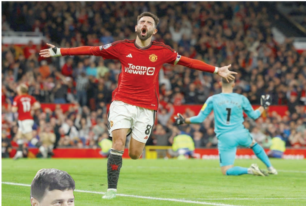
برونو نجم يوناييتد اختير رجل المباراة أمام نيوكاسل وأعلن رغبته في البقاء مع الفريق

وأضاف: «أن يكون في إمكاننا الوصول للمركز السادس هو أمر كبير لنا. تشيلسي فريق كبير والجميع يريد إنهاء الموسم في مركز أعلى من السادس، لكن عليك أن تنظر إلى ما كنا عليه في بداية الموسم. كل الفضل في ذلك للمدرب. جميع اللاعبين يجوبونه ويريدون القتال من أجله».