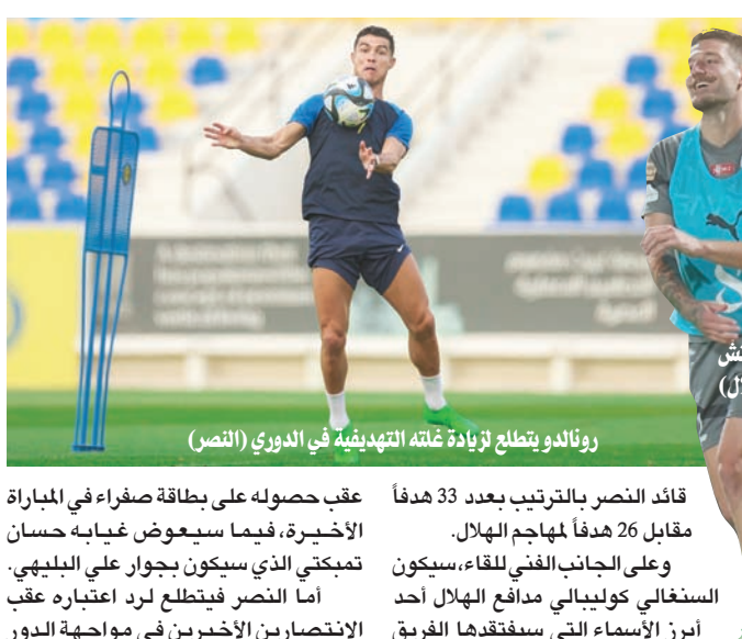
رونالدو يتطلع لزيادة غنائه التهديفية في الدوري (النصر)

في المقابل، سيكون النصر أمام مهمة إحراق الخسارة الأولى بفريق الهلال وتقليص الفارق النقطة بينهما، كونه يملك 77 نقطة ويتبعده عن «المتصدر» بفارق 12 نقطة. وستشهد المواجهة منافسة أخرى بين النجم البرتغالي كريستيانو رونالدو قائد النصر والصربي ألكسندر ميتروفيتش مهاجم الهلال، وذلك على صدارة ترتيب الهادفين، حيث ينفرد