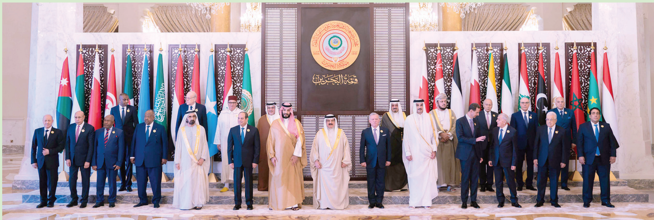
صورة جماعية لقادة وممثلي الدول العربية خلال مشاركتهم في «قمة المنامة» أمس

العراق فيما يخص نهري دجلة والفرات، والتضامن معهم جميعاً في اتخاذ ما يرونه من إجراءات لحماية أمنهم ومصالحهم المائية. كما رفض «إعلان البحرين» بشكل كامل «أي دعم للجماعات المسلحة أو الميليشيات التي تعمل خارج نطاق سيادة الدول وتتبع أو تنفذ أجناس خارجية تتعارض مع المصالح العليا للدول العربية، مع التأكيد على التضامن مع جميع الدول العربية في الدفاع عن سيادتها ووحدة أراضيها».