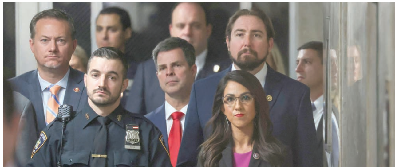
التأنيء الجمهورية بويرت وآخرون يتابعون تصريحات ترمب للصحافة قبل بدء جلسة محاكمته في نيويورك أمس