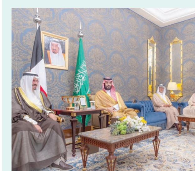
... وأثناء مشاورات مع رئيس الوزراء الكويتي الشيخ أحمد عبد الله الأحمد الصباح

وترأس ولي العهد السعودي وفد المملكة إلى القمة العربية القادمة في البحرين، حيث استهل كلمته بنقل تحيات خادم الحرمين الشريفين الملك سلمان بن عبد العزيز آل سعود، إلى المشاركين في القمة وتمنياته لها بـ«التوفيق والنجاح»، شاكرًا الملك البحريني حمد بن عيسى آل خليفة «ما لقيناه من حفاوة استقبال وكرم ضيافة». وشدد ولي العهد السعودي على «ضرورة العمل لإيجاد حل عادل وشامل للقضية الفلسطينية مبني على قرارات الشرعية الدولية ومبادرة السلام العربية بما يكفل حق الشعب الفلسطيني الشقيق في إقامة دولته المستقلة على