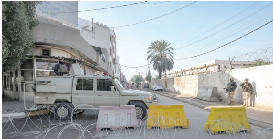
أرشيفية لعناصر أمن في نقطة تفتيش بالكاظمية قرب معسكر «الشعبة الخامسة»