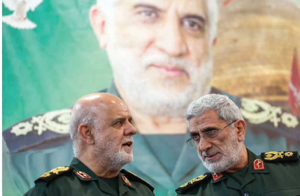
قأتي يستمع إلى مسجدي على هامش مراسم رأس أربعين محمد هادي حاجي رحيمي الذي قضى في ضربة إسرائيلية على القنصلية الإيرانية بدمشق

وقبل انضمامه المخبر للجدل إلى السلك الدبلوماسي، برز مسجدي