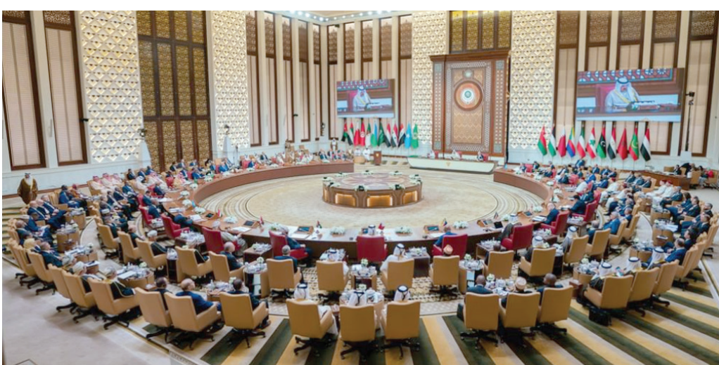
جانب من أعمال جلسة افتتاح القمة العربية التي استضافتها المنامة أمس

وبشأن الدعوة إلى تسوية سلمية عادلة وشاملة للقضية الفلسطينية، أيد «إعلان البحرين» دعوة الرئيس محمود عباس، رئيس دولة فلسطين، لعقد مؤتمر دولي للسلام، واتخاذ خطوات لا رجعة فيها لتنفيذ حل الدولتين وفق مبادرة السلام العربية وقرارات الشرعية الدولية لإقامة الدولة الفلسطينية المستقلة ذات السيادة على خطوط الرابع من يونيو (حزيران) عام 1967 وعاصمتها القدس الشرقية، وقبول