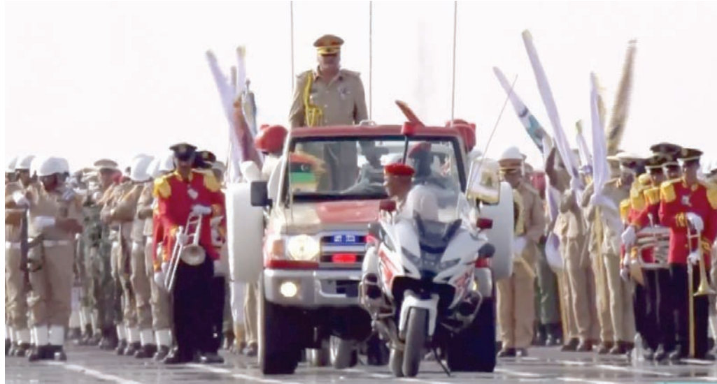
جانب من احتفال «الجيش الوطني» الليبي بذكرى إطلاق «عملية الكرامة»