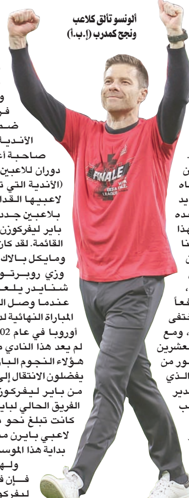
ألونسو تألق كلاعب ونجح كمدير

لقد تعلم ألونسو في الأندية الكبرى: ليفربول وريال مدريد وبايرن ميونيخ. وهناك، تعلم الكثير من اللعب تحت قيادة مديري فنيين عظماء. لقد كان رافاييل بينيتيز وجوزيه مورينيو يعملان على إغلاق المساحات أمام المنافسين بحيث لا يصلون إلى المرمى، مع تحقيق أقصى استفادة من اللحظة التي يستحوذ فيها الفريق على الكرة. أما غوارديولا فكان يعتمد دائماً على اللعب الهجومي، وكان استحواذ فريقه على الكرة في نصف ملعب المنافس يتطلب درجة أعلى من التنظيم.