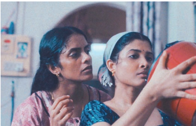
من الفيلم الهندي «كلنا نتخيل كضوء» (مهرجان كان)

حين تظهر في برنامج من نوع «رياليتي شون» تبدأ في الاعتقاد أن هذه هي الخطوة الأولى وأن عليها أن تتقدم إلى المعنيين بطلب توظيفها في برامج أخرى. لكن لا شيء يحدث ما يزيد من توترها