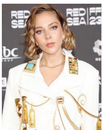
البنوي في مهرجان البحر الأحمر

وشاركت فاطمة البنوي في أعمال فنية، منها مسلسل «ما وراء الطبيعة»، أول مسلسل مصري من إنتاجات «تفليكس» الأصلية، وبعدها في بطولة مسلسل الإثارة النفسي «60 دقيقة»، من إخراج مريم أحمد، وبطولة ياسمين رئيس، ومحمود نصر، وشيرين رضا.