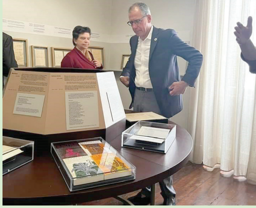
جانب من متحف كفافيس (الشرق الأوسط)

بعد عامين من بدء أعمال الترميم، بات بيت الشاعر اليوناني - المصري الاستهري قسطنطين كفافيس بالإسكندرية جاهزاً لاستقبال الزائرين مجدداً بعد إعادة افتتاحه أخيراً.