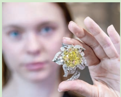
الجمال النادر