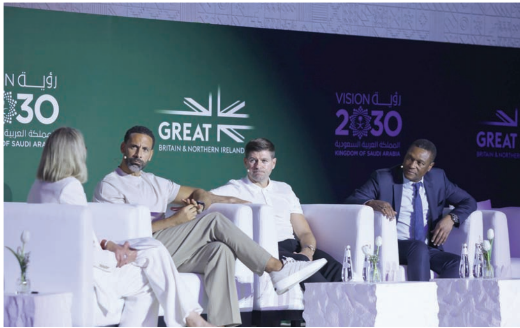
إيمينالو وجرارد وفرديناند خلال حديثهم أمس لـ«غریت فيتشرز» (المركز الوطني للتنافسية)

وعن قرار إضافة لاعبين أجانب من مواليد 2003، قال: «نحن نعمل لتهيئة الدوري السعودي ومستقبله للاعبين الأصغر سناً، سواء كانوا لاعبين محليين أو أجانب، من أجل خلق توازن بين أعمار اللاعبين في الفرق الكروية، لأنه في كل الأحوال سيأتي الوقت الذي سيتعين فيه على اللاعبين الكبار، إفساح المجال للاعبين الآخرين الأقل سناً»، مضيفاً: «بعد بضعة أشهر فقط من هذا المشروع، نحن نتحدث بحرية عن بعض أفضل اللاعبين الراغبين في القدوم إلى هنا، وأعتقد أن هذا أمر مثير». وفي سؤال وجهه له النجم الإنجليزي ريو فرديناند الذي يوجد