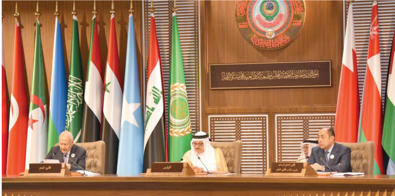
أعمال اجتماع وزراء الخارجية التحضيري للقمة العربية برئاسة وزير خارجية البحرين الدكتور عبد اللطيف الزباني

وفي مارس الماضي، قال الأمين العام للجامعة الدول العربية، أحمد أبو الغيط، في اجتماع وزراء الخارجية العرب بالقاهرة، إن اللجنة المختصة بتركيبة رصدت تطورات إيجابية في العلاقات بين الدول العربية وأنقرة، موضحاً أن هناك قراراً يتناول الحفاظ على التطور الإيجابي في هذا الإطار.