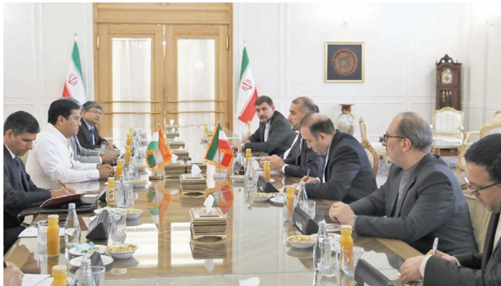
عبد الله الهيداني يجري مباحثات مع وزير الشحن الهندي سارياناندا سونوال في طهران أمس

وأجرى وزير الخارجية الإيراني حسين أمير عبد الله الهيداني، أمس (الثلاثاء)، مباحثات مع وزير الشحن الهندي سارياناندا سونوال، الذي يزور طهران لتوقيع العقد الجديد. ونقلت وكالة «أرنا» الرسمية عن عبد الله الهيداني قوله إن «الجمهورية الإسلامية الإيرانية تعدّ الهند شريكاً موثقاً»، مشدداً على نهج طهران للتوصل إلى تعاون طويل المدى مع نيودلهي.