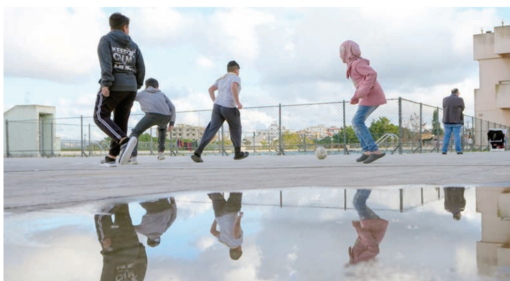
أطفال يلهون في مركز إيواء للنازحين في بلدة المروانية جنوب لبنان