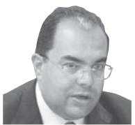
محمود محيي الدين

والتي تتجلى في حالة الولايات المتحدة بصور ثلاثة قوانين في عامي 2021 و2022 للاستثمار في البنية الأساسية، والرقائق وأشباه الموصلات والتحول الأخضر. وهي قوانين صنفها بنك الاستثمار الأميركي (جيه بي مورغان) بأنها تتشكل من مزيج من الإنفاق الحكومي وفرض قيود على التجارة والاستثمار. ورصد البنك المذكور إجراءات مماثلة من اليابان والاتحاد الأوروبي وكوريا الجنوبية.