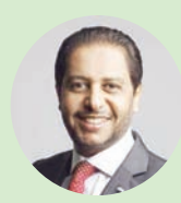
ضياء الدين سعيد

بمخرمة، سفير جمهورية جيبوتي لدى المملكة العربية السعودية، استقبله أول من أمس، فهد بن عبد الرحمن الجلال، وزير الصحة السعودي، في مكتبه بالوزارة، وجرى خلال اللقاء بحث عدد من