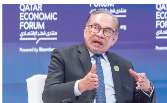
أنور إبراهيم يتحدث أمام منتدى اقتصادي تستضيفه الدوحة أمس الثلاثاء

وقال مسؤول كبير بوزارة الخزانة الأميركية، الأسبوع الماضي، إن الولايات المتحدة ترى أن قدرة إيران على نقل نفطها تعتمد على مقدمي خدمات في ماليزيا، إذ يتم نقل النفط من مكان بالقرب من سنغافورة، ومنه لجميع أنحاء المنطقة. وأضاف المسؤول الأميركي أن