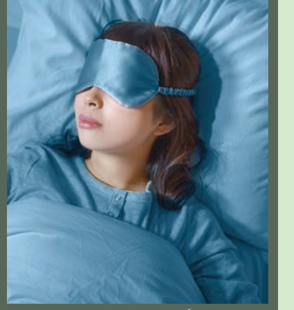
النوم ليس هائناً طوال الوقت