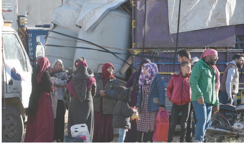
لاجئون يتحضرون لمغادرة منطقة عرسال باتجاه سوريا

عادت دفعة جديدة من اللاجئين في لبنان إلى سوريا، بعد توقف عملية العودة الطوعية التي كانت قد بدأت عام 2017، لنحو سبعة أشهر، كان آخرها في أكتوبر (تشرين الأول) الماضي.