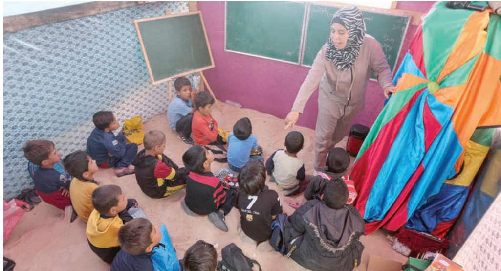
خيمة لتدريس الأطفال في خان يونس بعد تدمير مدارسهم