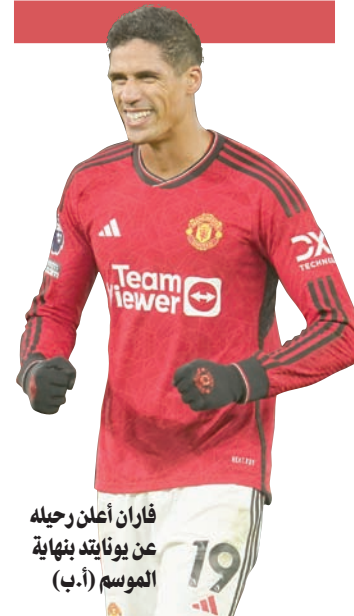
فاران أعلن رحيله عن يونايتد بنهاية الموسم

أليغري لإنقاذ مستقبله مع «السيدة العجوز»... وغاسبريني لتتويج موسمه التاريخي