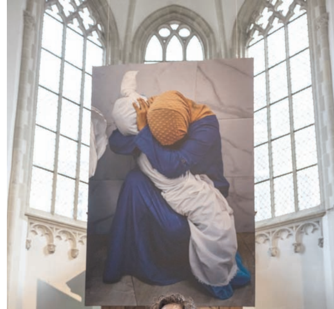
خوري وخلفها الصورة القاسية

الحرب، «الكنني أعلم أنه بسبب صورته، سيستمر الملايين في الحصول على فهم عاطفي وغريزي لما شعرت به هذه المرأة في تلك اللحظة. فهذا الفهم يولد رابطاً مباشراً بين متلقيها وأهل غزة، مما يتيح تجلّي البعد الإنساني».