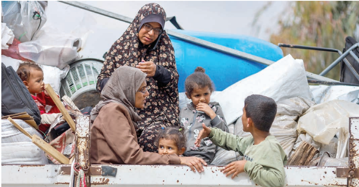
ناجون فلسطينيون من رفح أمس

واتخذت القاهرة خطوات تصعيدية تدريجية، منذ 7 مايو (أيار) الجاري عقب سيطرة إسرائيل على معبر رفح من الجانب الفلسطيني، منها رفض التنسيق مع إسرائيل، وإبلاغ جميع الأطراف المعنية بتحمل تل أبيب مسؤولية التدهور الحالي،