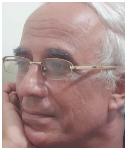
جار النبي الحلو