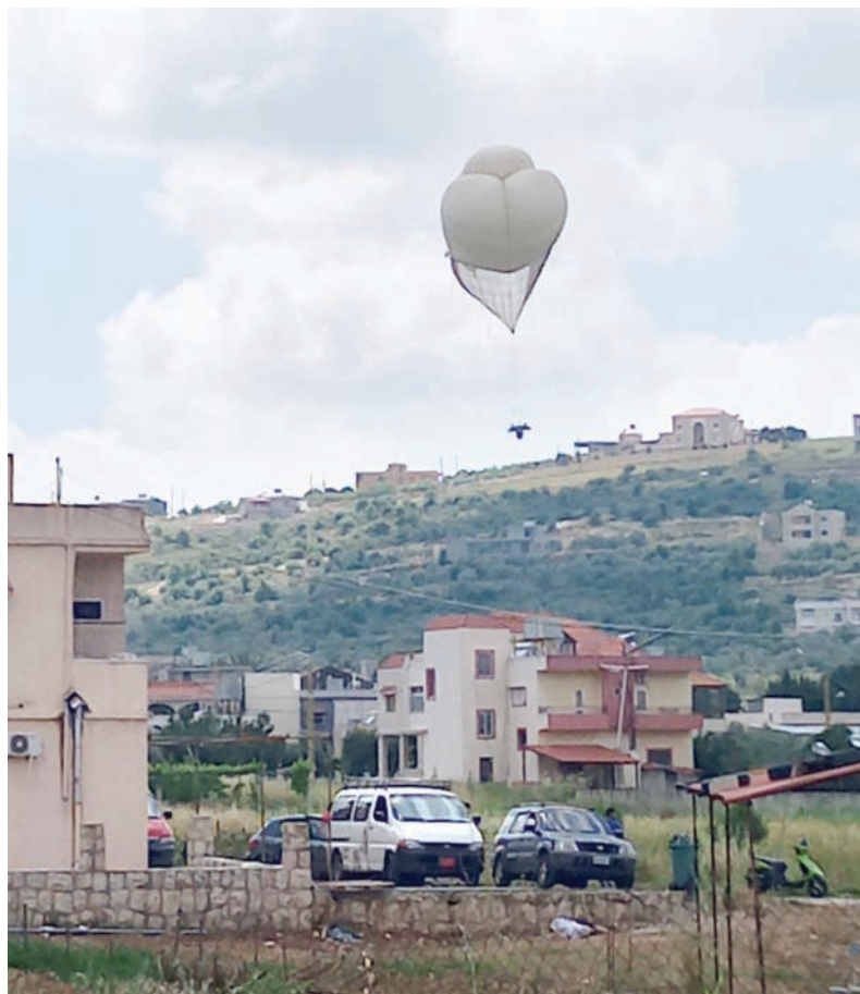
المنطاد التجسسي الإسرائيلي الذي سقط على أطراف بلدة ريمش (أ.ب.ب)

متطور جداً، ويمكن أن يطوف على ارتفاع متوسط أو عالٍ، وصولاً لـ 6 آلاف قدم، وفيه كاميرات تلتقط صوراً دقيقة من كل الاتجاهات على مدار 360 درجة، ويتم نقلها مباشرة إلى غرفة عمليات، لافتاً في تصريح لـ «الشرق الأوسط» إلى أن الحزب «تقصد عدم استهداف المنطاد، وإنما قاعدة إطلاقه وآلية التحكم به كي يحصل عليه بشكل سليم ويدرس خصائصه»، مضيفاً: «ما حصل إنجازه عسكري مهم جهة اكتشاف القاعدة التي أطلقت المنطاد وإصابتها، ما يطرح علامات استفهام حول دور القبة الحديدية التي سمحت بـ 3 إصابات». بالمقابل، أفيد عن شن الطيران الحربي الإسرائيلي، ليل الإثنين - الثلاثاء، غارتين على بلدة الخيام، وغارة عنيفة بـ 4 صواريخ استهدفت بلدة كفر كلا، استخدمت خلالها صواريخ ثقيلة، تسمى صواريخ «شارون» الزلزالية، أحدثت دماراً كبيراً في البلدة.