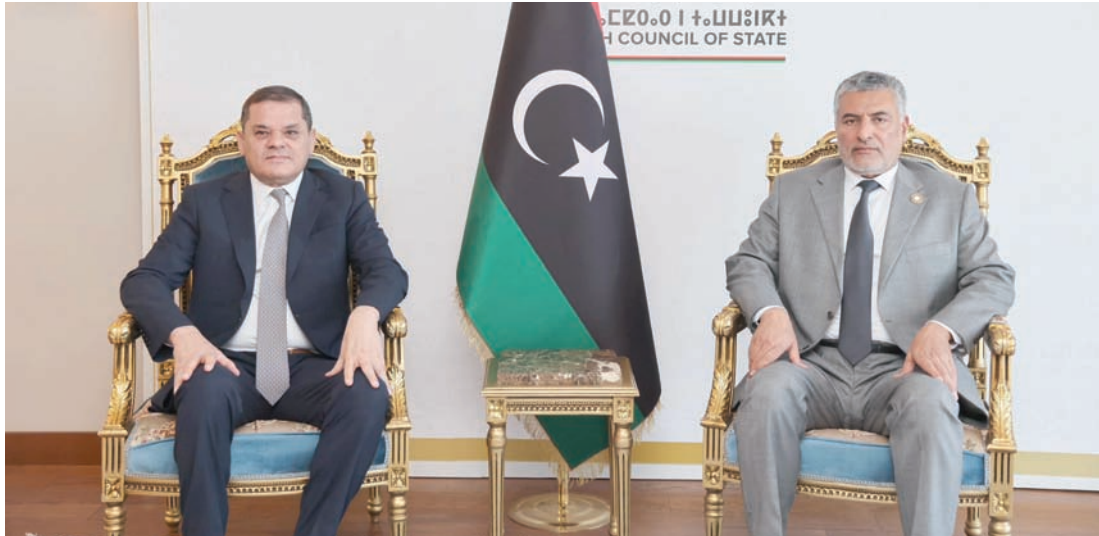
اجتماع الدبلوماسية وتكاتف (حكومة «الوحدة»)

أعلن عبد الحميد الدبيبة، رئيس حكومة «الوحدة الوطنية» الليبية المؤقتة، إعادة هيكلة «قوة التدخل والسيطرة» بغرب البلاد، بعد اشتباكات مفاجئة في العاصمة طرابلس، بين عناصر «جهاز الأمن العام» التابع لها، بقيادة عبد الله الطرابلسي الشهير بـ«فراولة»، شقيق وزير الداخلية المكلف عماد الطرابلسي.