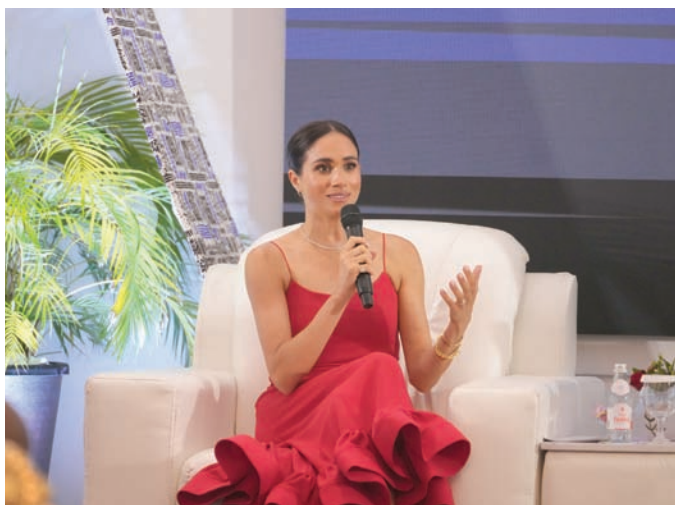
اختيارها فستاناً من ماركة نيجيرية كان لفئة دبلوماسية ذكية

بان سبب خروجها عن طوع العائلة البريطانية في عام 2020 كان توقها للعيش في سلام بعيداً عن القيود والأضواء الناتجة عن التغطيات الإعلامية السامة. لكن واقع الأمر بالنسبة لمنقدها يقول العكس. فهي متمسكة باسم العائلة ولا تريد أن تستغني عن القيمة التي تضيفها إليها. كل ما في الأمر أنها كانت تريد مفضلة على مقاسها وحسب مزاجها، حسب رأيهم. كل هذا تمكّنوا من قراءته من خلال إطلاقاتها. الرسائل التي تضمنتها الرحلة أصابت في بعضها وخابت في البعض الآخر. ومع أن الأزياء في حد ذاتها لا خلاف عليها، من ناحية أنقائها ونعومتها، فإنها من الناحية الدبلوماسية، قسمت المتابعين إلى فئتين: فئة مقبولة، وفئة ترى أنها فشلت في قراءة ثقافة البلد المضيف على أساس أنه مسلم ويُفترض احترام تقاليده وعاداته. ظهر هذا من أول يوم، عندما ظهرت بفسطان طويل يظهر مكشوف ثلثه فساتين أخرى إما بفتحات عالية أو صدر مفتوح، فيما كان أغلبها من دون أكمام.