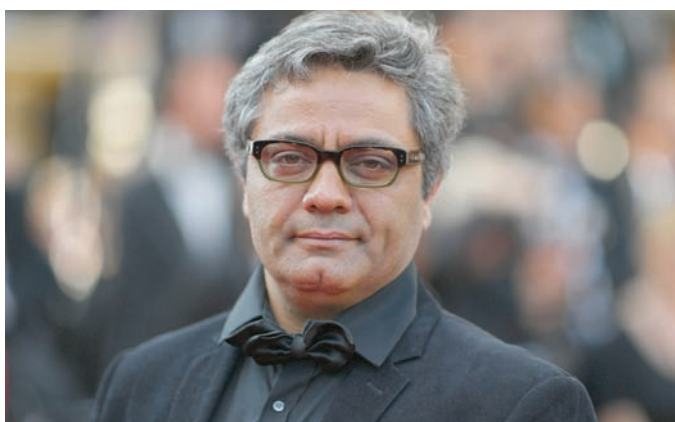
رسولوف خلال حفل توزيع جائزة «نظرة ما» في مهرجان «كان» عام 2017

عن حرية التعبير. وأثار البيان تكهنات بأن رسولوف قد يحضر العرض الأول لفيلمه «بذرة التين المقدس» الجمعة المقبل. وقال المخرج الذي فاز من قبل بالجائزة الكبرى لمهرجان «برلين السينمائي» عن فيلم «لا يوجد شر» عام 2020 إن السلطات الإيرانية ضغظت عليه من أجل سحب فيلمه من مهرجان كان.