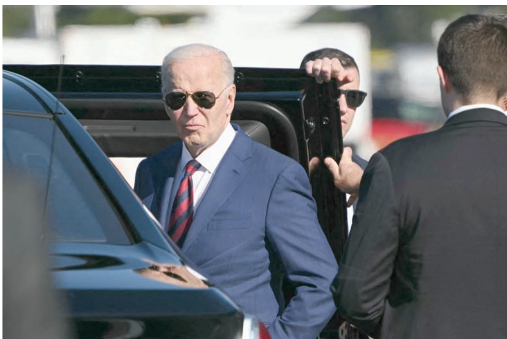
الرئيس الأميركي يستمع لسؤال من الصحفيين قبل ركوب سيارته لدى وصوله إلى مطار سياتل تاكوما الدولي

في المقابل، روجت حملة بايدن الانتخابية لما أسمته «إنجازات في تعزيز البنية التحتية المحلية»، وخلق مزيد من الوظائف، وتعزيز الاقتصاد الأميركي. ويقول المحللون إنه يتعين على الرئيس بايدن تحقيق توازن دقيق، بين هذه الرسوم الجمركية الإضافية حيث تخاطر بزيادة الأسعار للمستهلكين الأميركيين، وسط شكوى متزايدة للمناخين من ارتفاع معدلات التضخم، وإثارة غضب الصين التي قد ترد بالمثل في عمليات انتقامية ضد السلع الأميركية.