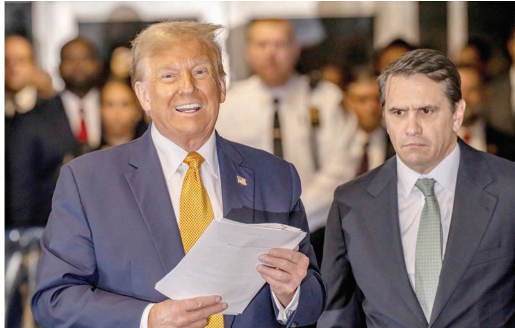
ترمب يتحدث للإعلام ويحافظ على صمته أمام المحكمة نيويورك أمس الثلاثاء

وعلى الرغم من أن شهادته لم تكن بقوة شهادة سنورمي دانيلز أمام