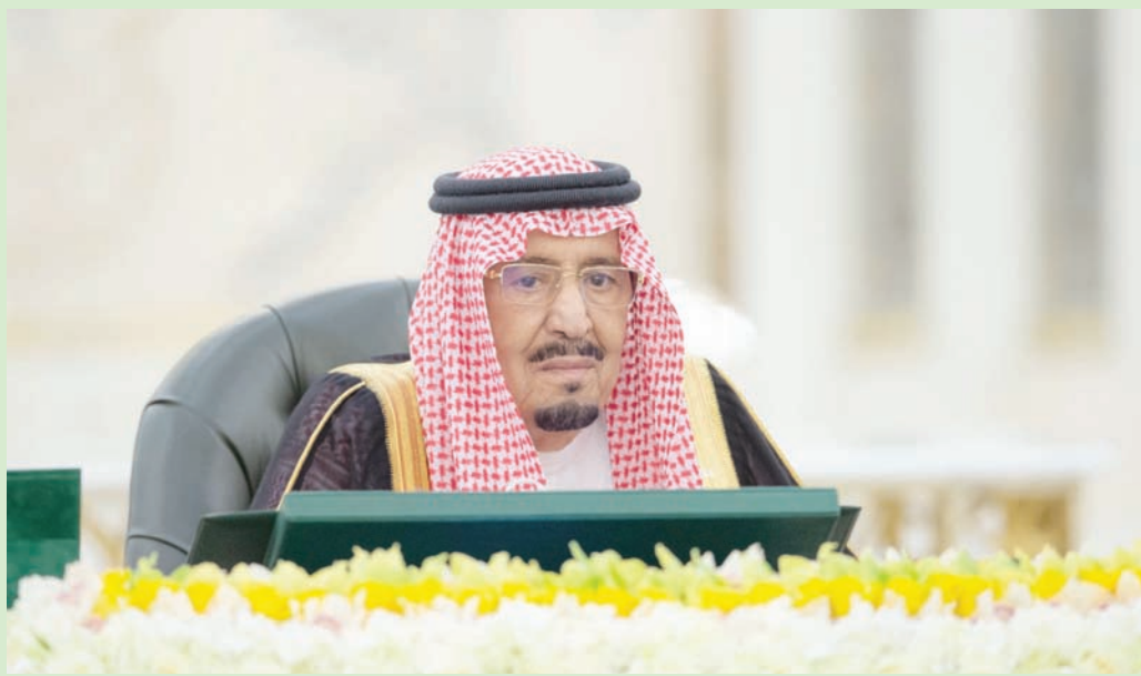
خادم الحرمين الشريفين لدى ترؤسه جلسة مجلس الوزراء في جدة الثلاثاء

كما أطلع مجلس الوزراء، على عدد من الموضوعات العامة المدرجة على جدول أعماله، من بينها تقارير سنوية للمجلس الأعلى للقضاء، وبنك التنمية الاجتماعية، وصندوق تنمية الموارد البشرية، وصندوق التنمية الزراعية، وقد اتخذ المجلس ما يلزم حيال تلك الموضوعات.