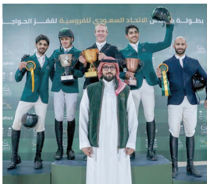
الفرسان السعوديون الذين سيشاركون في أولمبياد باريس