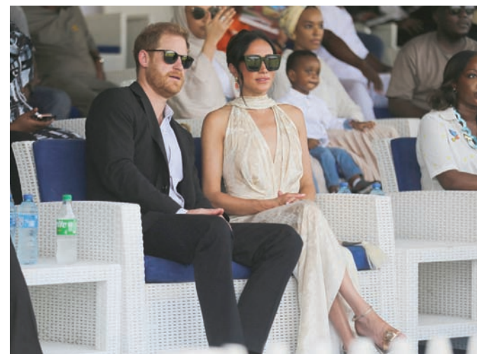
كل شيء هدفه أن تأتي الصورة موقفة من كل الزوايا

النظرية على الطريقة المحسوبة التي كانت تمشي وتجلس بها. أكتاف عالية ورأس مرفوع وابتسامة مرسومة لا تفارق وجهها. كل لقطة تم تداولها تُظهرها حريصة أن تأتي موقفة من كل الزوايا. لم يفت أحداً أن الأزياء تضمنت رسائل مبطنّة فيها نوع من التحدي