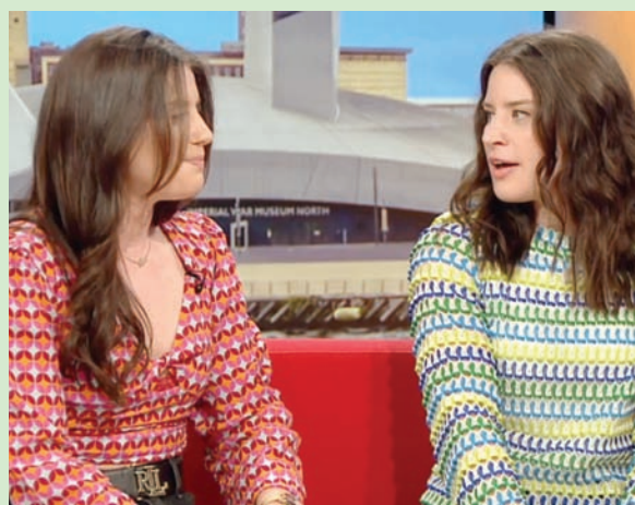
لقطة من فيديو بثته «بي بي سي» للشقيقتين

وقالت «سوذيبيز» إن الماسة أخرى غير مركبة ولا تشوبها شائبة من الداخل يزيد وزنها على 37 قيراطاً، ستعرض للبيع في المزاد عينه.