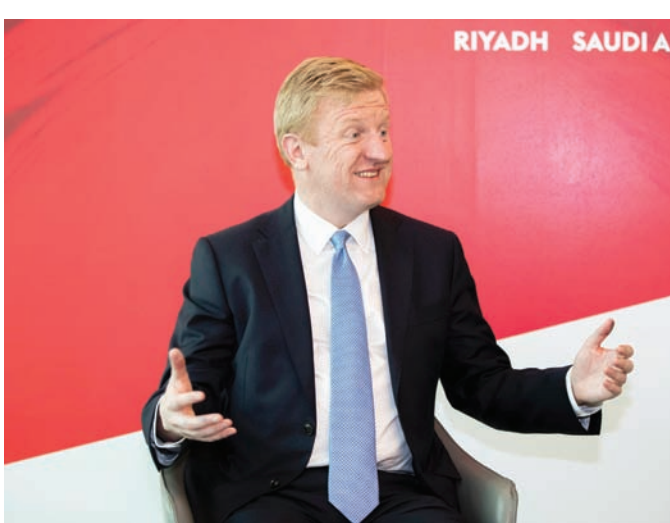
نائب رئيس الوزراء البريطاني متحدثاً لـ «الشرق الأوسط»

واحتجاز الكربون وتخزينه (CCUS). ونحن حريصون على بذل مزيد من الجهود معاً في البحث والابتكار في مجال الطاقة المتجددة، إذ تعد السعودية بمثابة اختبار لكثير من الابتكارات التي ستغير حياتنا جميعاً، من الطاقة النظيفة إلى أنماط الحياة الصحية. لماذا تعد ممارسة الأعمال التجارية أسهل في المملكة العربية السعودية؟ لدينا روابط تجارية قوية وممارسات تجارية راسخة. تحتل السعودية المرتبة العشرين بين أكبر أسواق التصدير في المملكة المتحدة بإجمالي صادرات بقيمة 11,7 مليار جنيه إسترليني على مدار الأرباع الأربعة حتى نهاية الربع الثاني من عام 2023.