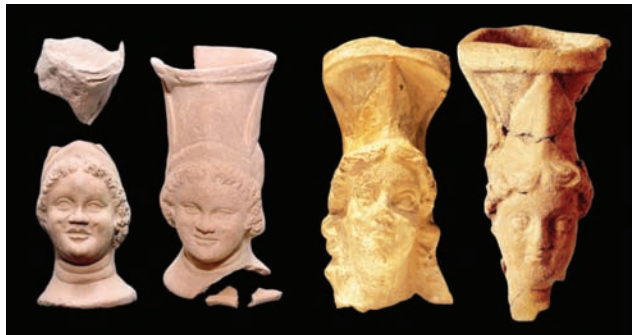
مبخرتان أثويتان من فيلكا تقابلهما مبخرتان من قلعة البحرين