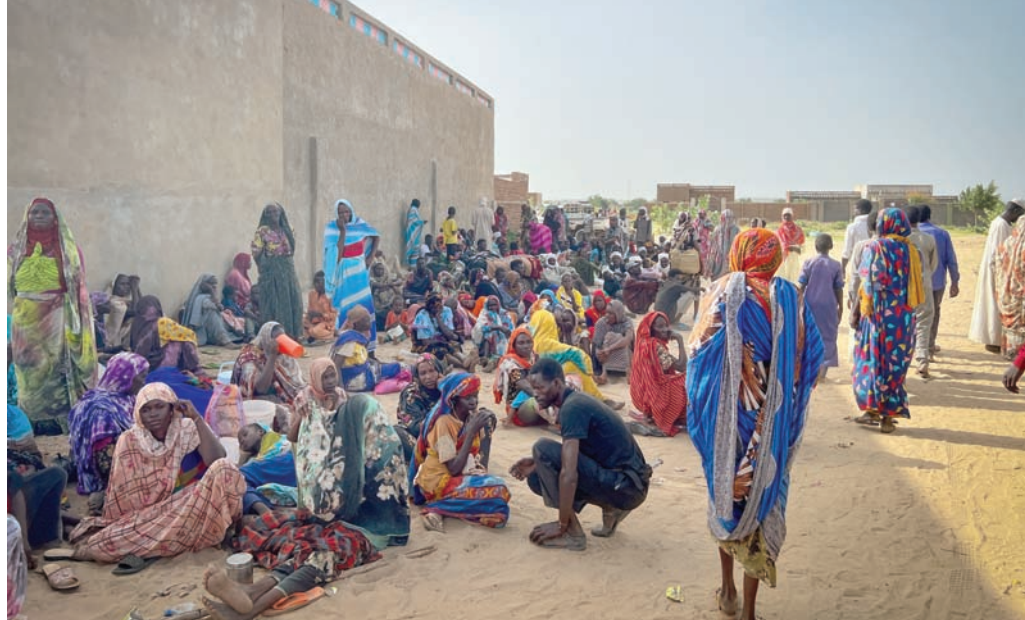
أرشيحية لسودانيين في إقليم دارفور

انتسعت الاشتباكات واشتد القتال العنيف بين الجيش السوداني و«قوات الدعم السريع»، الثلاثاء، في مدينة الفاشر عاصمة ولاية شمال دارفور (غرب البلاد)، في وقت أفاد مسؤولون في قطاع الصحة بالولاية بمقتل 38 مدنياً جراء المعارك. وأفاد شهود عيان لـ«الشرق الأوسط» بزيادة وتيرة القصف المدفعي المتبادل في أنحاء الفاشر التي تعد المعقل الأخير للجيش السوداني وحلفائه من الحركات المسلحة في إقليم دارفور، وتحاول «الدعم السريع» السيطرة عليها لإحكام نفوذها على الإقليم الذي باتت 4 من أصل 5 ولايات تشكله تحت إمرتها. في السياق، أعلنت السلطات الصحية بولاية شمال دارفور ارتفاع عدد القتلى المدنيين إلى 38 شخصاً، وإصابة 280 آخرين في الاشتباكات.