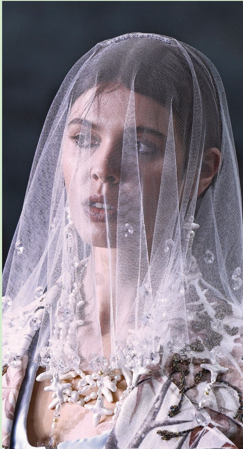
عارضة أزياء ترتدي تقسيماً لـ «بيلا دافين» خلال عرض «إف. دي. إس: المبتكرون» ضمن أسبوع الموضة الأسترالي في سيدني

أقرب سبيل لتقليص مساحات الظلام هذه هو تسليط أشعة الشمس عليها لمحو الظلام واكتساح عيون مضاصي الدماء. ذلك يكون بفتح نقاشات جريئة وجديدة ضد فكر كل جماعات المضلة الإرهابية.