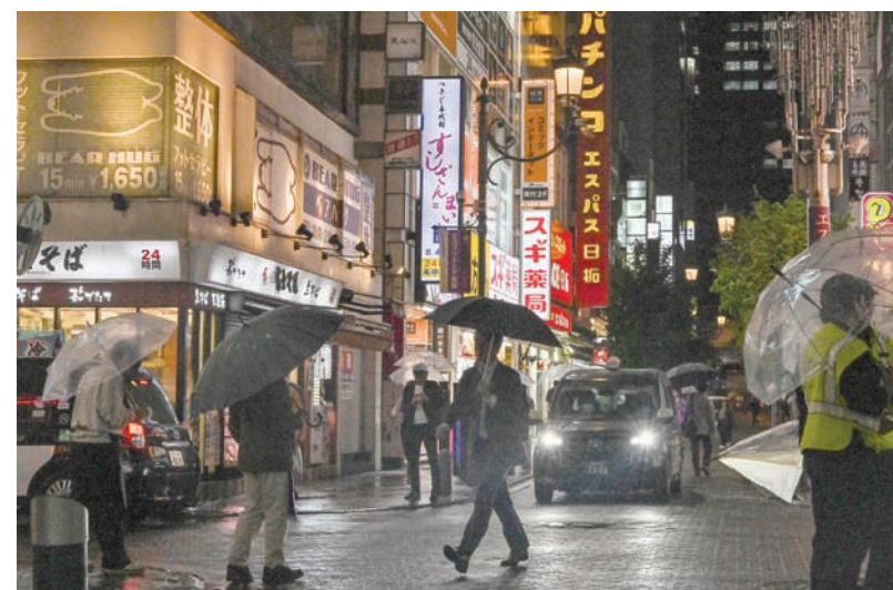
مشاة في أحد شوارع وسط العاصمة اليابانية طوكيو

الاقتصاد الياباني استمر في النمو بعد الوباء، مع زيادات واسعة النطاق في الأسعار بعد ثلاثة عقود من التضخم المنخفض. إلا أنه رغم توقع أن تكون فجوة الإنتاج قد أغلقت، ومع ذلك، فإن الانعكاش لا يزال متفاجئاً. وفي حين ارتفعت صادرات السلع والخدمات فوق ذروة ما قبل الجائحة، فإن الاستهلاك الخاص والاستثمار لا يزالان عند مستويات منخفضة.