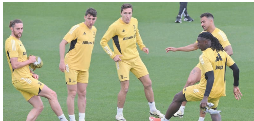
لاعبو يوفنتوس يأملون إنقاذ موسمهم بالتتويج بالكأس الإيطالية

بعد قيادته يوفنتوس إلى 11 لقباً في فترة أولى امتدت خمس سنوات، فشل ماسيميليانو أليغري في لعب دور المنقذ لنادي «السيدة العجوز» في فترته الثانية، لكن الرجل الخمسيني أمامه فرصة للتتويج بكأس إيطاليا لكرة القدم عندما يواجه أتالانتا اليوم، والإفلات من مصيصة الإقالة.