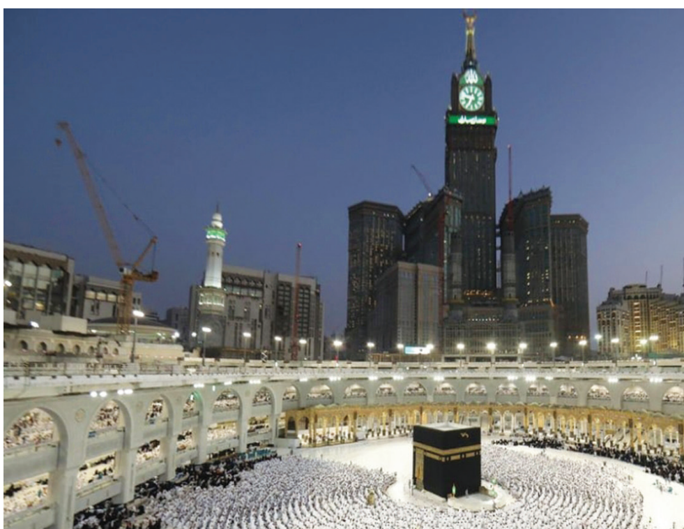
يُعد المنتدى بإبراز الجهود والمشاريع الاستثنائية التي تبذلها المملكة (الشرق الأوسط)