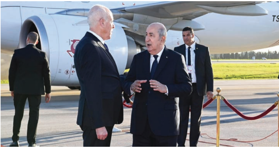
الرئيسان الجزائري والتونسي في مارس 2024 (الرئاسة الجزائرية)

حينها، الاتفاق على تنظيم قمة كل ثلاثة أشهر «لتنسيق أطر الشراكة والتعاون، على أن يكون اللقاء الأول وتوقع «مزيماً من الوقت، لتوضيح التوجهات المتخلفة من هذا التكتل، خاصة في ظل ضغوط ممثلين الاتحاد الأوروبي على الدول الثلاث، في ملف الهجرة غير النظامية». ورأى العرفاوي، أنه «في حال سيطرت التوجهات الاقتصادية على هذا التكتل، فإن تونس ستكون أكبر مستفيد من ذلك، في ظل ندرة الموارد المالية الذاتية، وصعوبة الإقلاع الاقتصادي بعد أكثر من 13 سنة على ثورة 2011 ذات الخلفية الاقتصادية والاجتماعية».