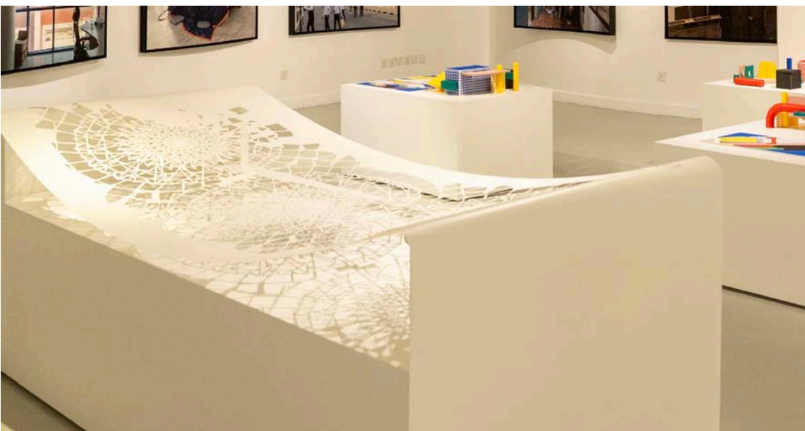
رحل المعماري المبدع عام 2017 وترك إرثاً معمارياً عريقاً (فناء الأول)