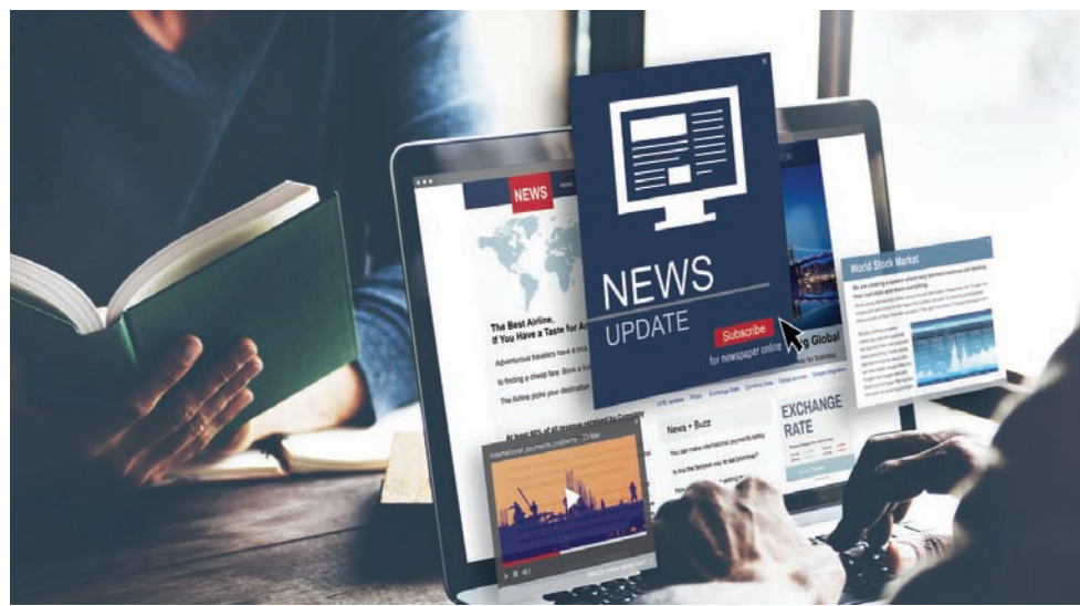
مخاوف بشأن تأثير التشريعات الخاصة بالحد من «الأخبار الزائفة» على الحريات الإعلامية

ويتابع بأن «كثيراً من الدول التي وضعت مثل هذه التشريعات في السنوات الأخيرة، سجلتها في حرية