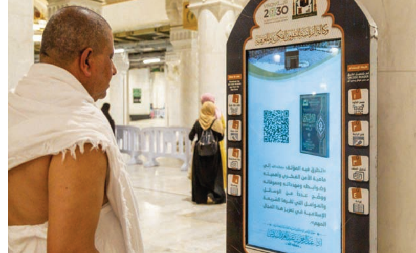
جانب من الخدمات التقنية المقدمة لضيوف الرحمن (الشرق الأوسط)

كما يقدّم بيئة مثالية للتفاعل والتواصل بين الشركات الناشئة والمستثمرين والأفراد المهتمين بمجال ريادة الأعمال.