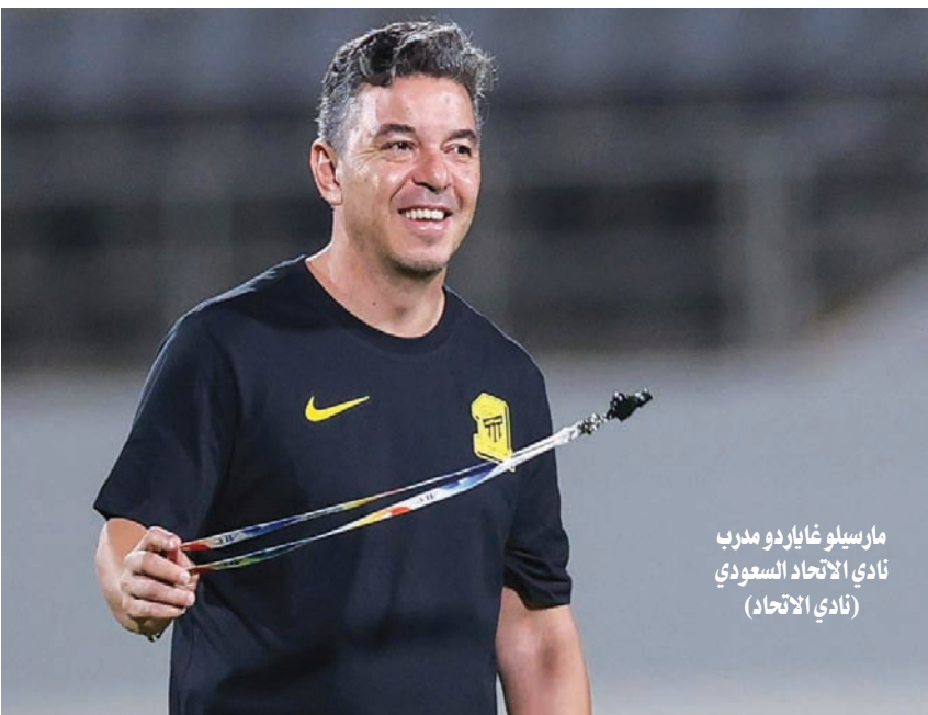
مارسيلو غاياردو مدرب نادي الاتحاد السعودي (نادي الاتحاد)

قيادة المدرب المقال نونو سانتو خلال 56 مباراة أشرف عليها المدرب مع الاتحاد بمعدل 0,6 هدف في اللقاء الواحد.