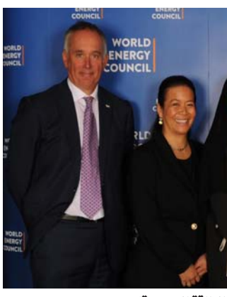
الإعلان عن استضافة السعودية للمؤتمر في 2026 من قبل رئيسة مجلس الطاقة العالمي (وزارة الطاقة السعودية)

الأمير عبد العزيز بن سلمان عند إعلان الاستضافة: «نسعد في المملكة باستضافة مؤتمر الطاقة العالمي لعام 2026، في هذا الوقت الذي يمثل مرحلة مهمة لقطاع الطاقة العالمي... وستسعى المملكة جاهدة، من خلال تنظيم هذا المؤتمر، لتحقيق الأهداف التي يرمي إليها المؤتمر، والتي تتطلع إليها المملكة من خلال (رؤية السعودية 2030)». وفق الموقع الرسمي لمجلس الطاقة العالمي، يدور برنامج مؤتمر الطاقة العالمي حول خمسة مواضيع أساسية للتقدم في التحول إلى الطاقة النظيفة والشاملة، وهي: عرض خرائط الطاقة الجديدة، وسبل التزود بالوقود في المستقبل، وإضفاء الطابع الإنساني على الطاقة عبر إشراك الناس والمجتمعات في تحقيق تحولات الطاقة العالمية، وربط أمن الطاقة والقدرة على تحمل التكاليف والاستدامة، وسد الفجوات وستتقود البرنامج مجموعة