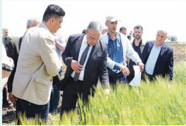
وزير الزراعة محمد حسان قطنا يتفقد محصول القمح في حماة والغاب أمس

مع ازدياد التوقعات في سوريا بمحصول قمح أفضل من الأعوام السابقة بعد هطولات مطرية جيدة شهدتها البلاد هذا العام، بدأت آفات القمح الاقتصادية (مرض الصدا الأصفر وحشرة السنونة) بالظهور لتهدد مواسم القمح، وذلك بينما يشكو الفلاحون من ارتفاع تكاليف الإنتاج، المقدرة بستة آلاف ليرة سورية لكل كيلو الواحد، ومطالبات بضرورة تأمين المازوت اللازم للسقاية الأخيرة، مع تجديد مطالباتهم برفع سعر شراء كيلو القمح وسط وعود حكومية برفع السعر، وتوقعات بالا يتجاوز السعر 5500 ليرة.