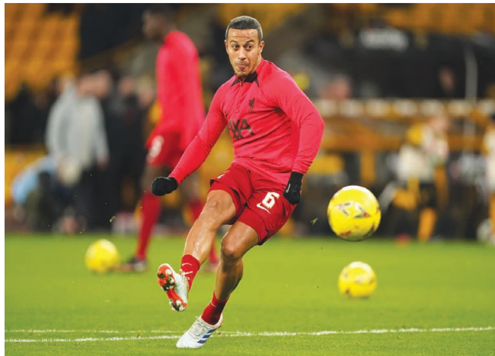
الإسباني الدولي تياغو ألكانتارا

وعانى تياغو من سلسلة من الإصابات العضلية منذ بداية الموسم، حيث لعب نجم ليفربول البالغ من