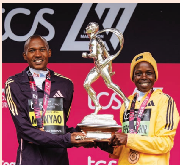
جيشير شير وموتيسو يحتفلان بالتتويج في ماراثون لندن

وحل البريطانيان إميل كاريس ومحمد محمد في المركزين الثالث والرابع توالياً. ولدى السيدات، حققت بطلة ماراثون طوكيو الأولمبي جيبيشير شير رقماً قياسياً عالمياً في سباق حصري للسيدات بلغ ساعتين و16 دقيقة و16 ثانية.