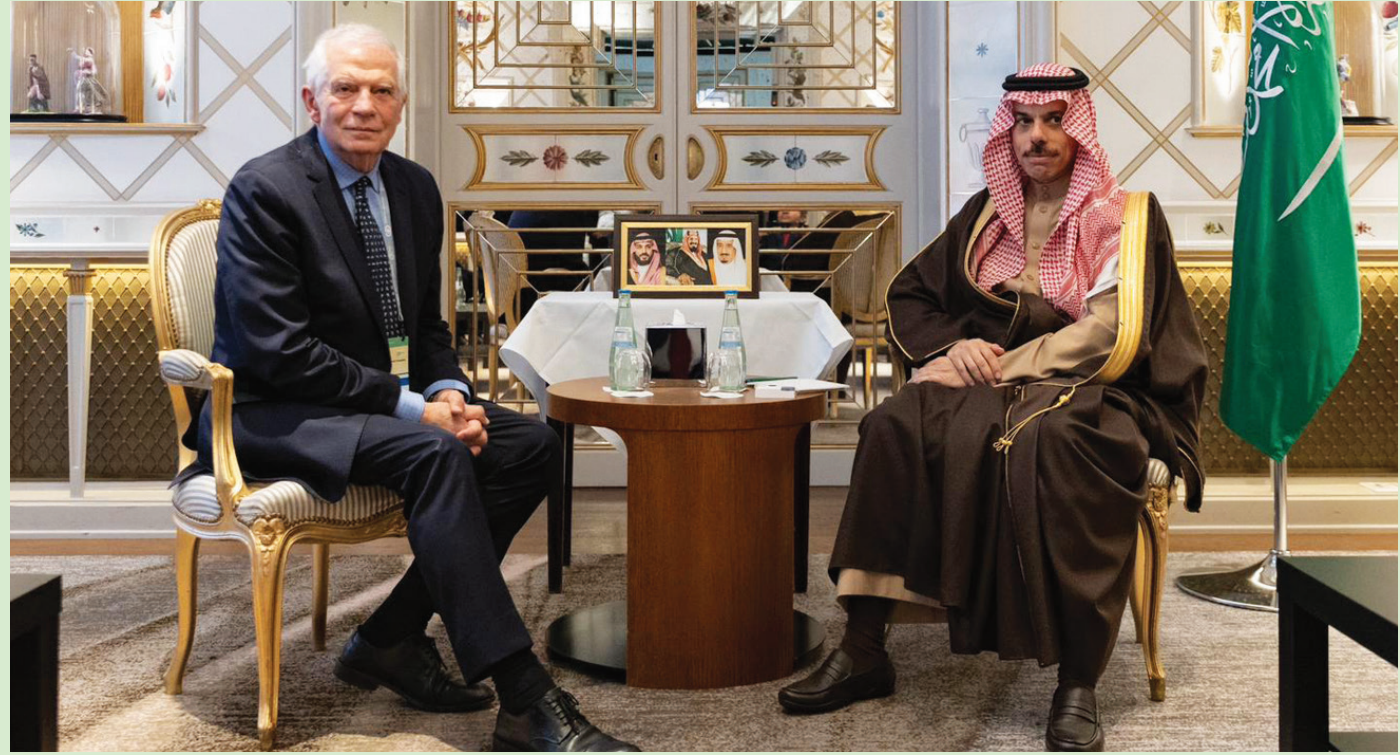
3 لقاءات جمعت وزير الخارجية السعودي والممثل الأعلى للسياسة والأمن الأوروبي جوزيب بوريل منذ أحداث السابع من أكتوبر الماضي (واس)

التنسيق في قضايا الاستقرار والأمن الإقليمي والعالمي». وفي 18 من الشهر الماضي، التقى الأمين العام لمجلس التعاون في بروكسل، بالممثل الخاص للاتحاد الأوروبي لمنطقة الخليج لوجي دي مايو، لمناقشة التحضيرات للمنتدى، والموضوعات التي سيتم مناقشتها خلال الاجتماع، وفي مقدمتها «الأوضاع الخطيرة في قطاع غزة»،