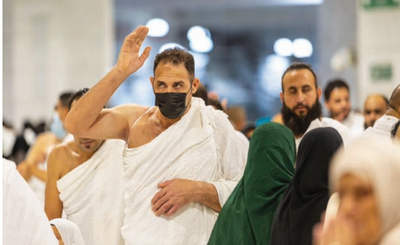
سيفاقس المنتدى التحديات لتقديم أفضل الخدمات (الشرق الأوسط)

ويُعد منتدى العمرة والزّيارة بإبراز الجهود والمشاريع الاستثنائية التي تبذلها المملكة في راحة المعتمرين والزوّار، وإثراء وتحسين تجربتهم في زيارة المملكة من مختلف أنحاء العالم، واستعراض أفضل الممارسات الإدارية والتشغيلية، وتبني الحلول التطويرية التي تسهم في استدامة رفع مستويات جودة الخدمات المقدمة في ظلّ تنامي أعداد المعتمرين والزوّار؛ من خلال تقديم منتجات مبتكرة واستكشاف الفرص الواعدة في هذا القطاع، فضلاً عن إطلاق كثير من المبادرات والتسهيلات الجديدة، التي تأتي بتكمن من «رؤية السعودية 2030».