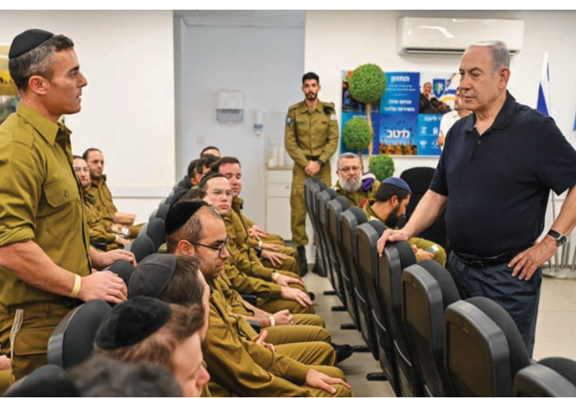
رئيس الوزراء الإسرائيلي بنيامين نتنياهو يلتقي معجندين من الحريديم في الجيش

وقد جاء التطور الجديد ضد الوحدة العسكرية المذكورة وانتقنن آخرين لم يعلن عنهما بعد، لإظهار «التوازن» أمام الدعم الهائل لإسرائيل في الحرب وقرار الكونغرس.