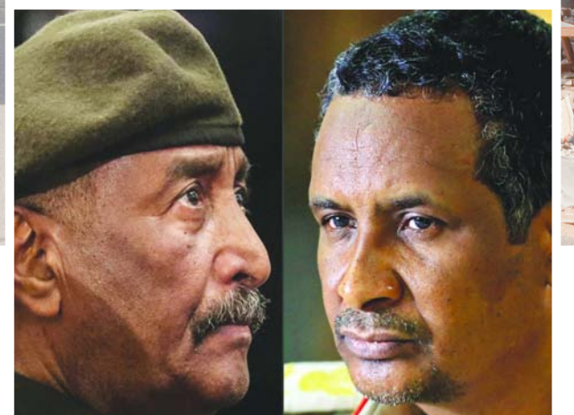
قائد الجيش البرهان (يسار) وقائد «الدعم السريع» حميدتي (أرشيفية)

شنته حركة العدل والمساواة) المتمرده، على مدينة أم درمان في عام 2008».