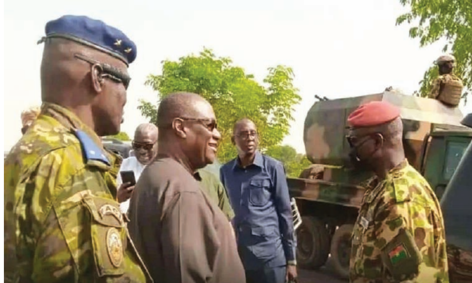
وزير دفاع بوركينافاسو لدى استقبال نظيره الإفوارتي

خلال الحرب الأهلية الأولى في كوت ديفوار ما بين 2002 و2007، وحتى خلال الحرب الأهلية الثانية عام 2010، شكلت بوركينافاسو قاعدة خلفية انطلاق منها المتمردون الإفواريون، بمن فيهم الرئيس الإفوارتي الحالي الحسن واتارا. هذا بالإضافة إلى تدخل اجتماعي وثقافي على شريط حدودي يزيد على 500 كيلومتر، بالإضافة إلى جالية من بوركينافاسو في كوت ديفوار تزيد على 2,2 مليون نسمة،