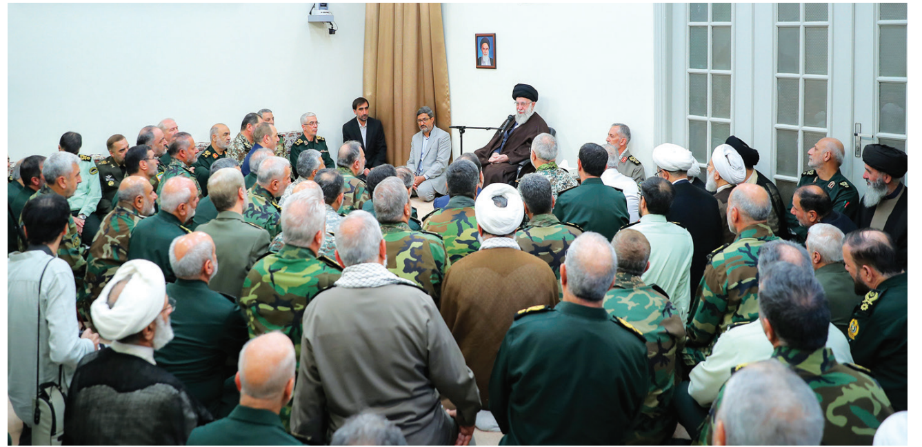
خامنئي خلال لقائه قادة عسكريين من القوات المسلحة الإيرانية