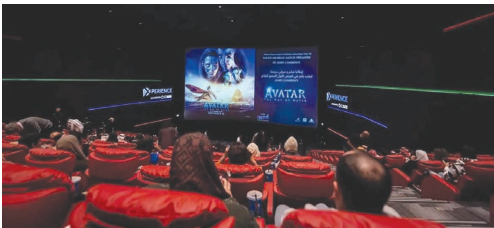
تعمل الحكومة السعودية على تحفيز القطاع السينمائي والمساهمة الاقتصادية للشركات العاملة في القطاع

وقرر المجلس كذلك نقل اختصاص ترخيص تشغيل استوديوهات الإنتاج، وإنتاج المحتوى المرئي والمسبوق، والاسترداد وتوزيع الأفلام السينمائية، وأيضاً ترخيص عدم الممانعة للتصوير السينمائي، إلى هيئة الأفلام، وبدء استقبال طلبات التراخيص من خلال منصة «إبداع» الثقافية.