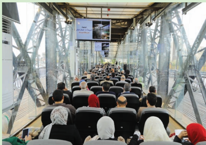
الجسر من الداخل (محافظة دمياط)