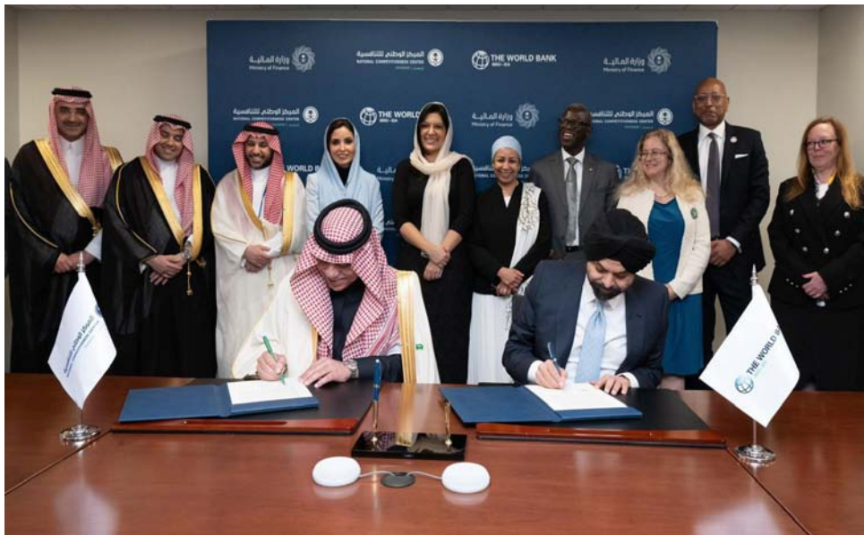
اختيار السعودية مركزاً للمعرفة نظير تجربتها الرائدة خلال الأعوام الماضية (واس)

في استدامة التطوير وتحفيز جميع القطاعات لتحقيق التنافسية والالتزام بها كقاعدة للتنمية الاقتصادية. وأشار إلى الدور المهم الذي قامت به وزارة التجارة في تطوير القطاع التجاري ورفع كفاءته، وتحقيق متطلبات التنافسية العالمية، وتطوير بيئة الأعمال، واستكمال البنى التحتية ومعالجة التحديات، ما أسهم في جعل بيئة الأعمال السعودية من أهم البيئات المحفزة للشركات والمنشآت بأنواعها، وأسهم في تقدم المملكة في مؤشرات التنافسية العالمية في عام 2023، محققة لأول مرة في