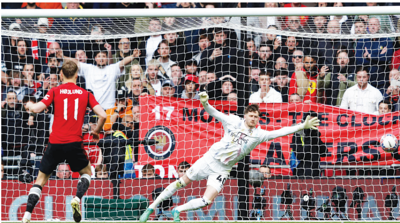
هولوند مهاجم يونايتد يسجل ركلة الترجيح الأخيرة حاسماً الانتصار على كوفنتري

ولم يخض فيلا المسابقة القارية إلا منذ موسم 1982 - 1983 حين