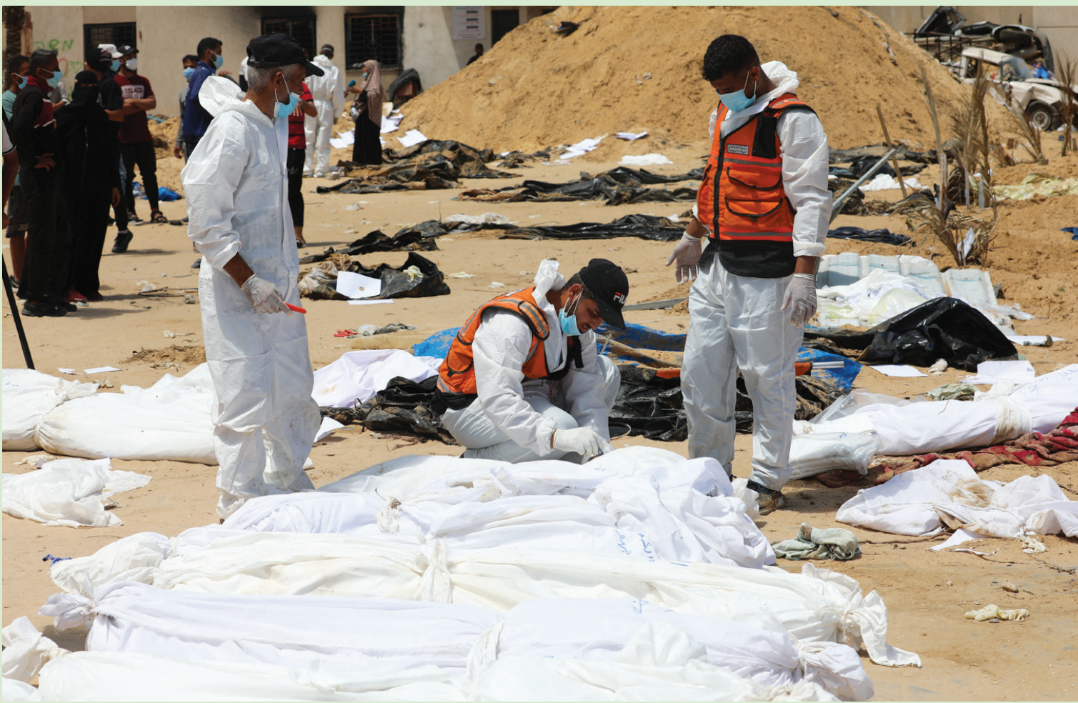
عمال «الدفاع المدني» يجهزون جثثاً اكتشفت في مقبرة جماعية بـ«مجمع ناصر» الطبي خلال الهجوم الإسرائيلي لنقلها إلى مقبرة في خان يونس أمس

سيتصدى لأي عقوبات تُفرض على أي وحدة عسكرية إسرائيلية، وذلك بعدما ذكرت وسائل إعلام أن واشنطن تعزز اتخاذ مثل هذا القرار ضد وحدة «نيستسج يهودا» بسبب اتهامها بارتكاب انتهاكات لحقوق الإنسان. كما ذكرت صحيفة «هارتس» الإسرائيلية أن عضو مجلس الحرب بيني غانتس حذر وزير الخارجية الأميركي أنتوني بلينكن من فرض عقوبات أميركية على الوحدة العسكرية الإسرائيلية.