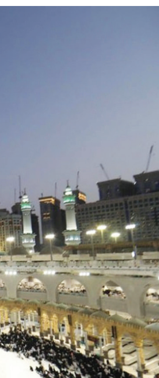
يُعد المنتدى بإبراز الجهود والمشاريع الاستثنائية التي تبذلها المملكة (الشرق الأوسط)

ويُقام المنتدى بحضور عدد من المسؤولين الحكوميين، وقدمي الخدمات في القطاع الخاص من جهات، وشركات، ومؤسسات مرتبطة بقطاع العمرة والزّيارة، ورواد الأعمال والمبتكرين والخبراء والعاملين في