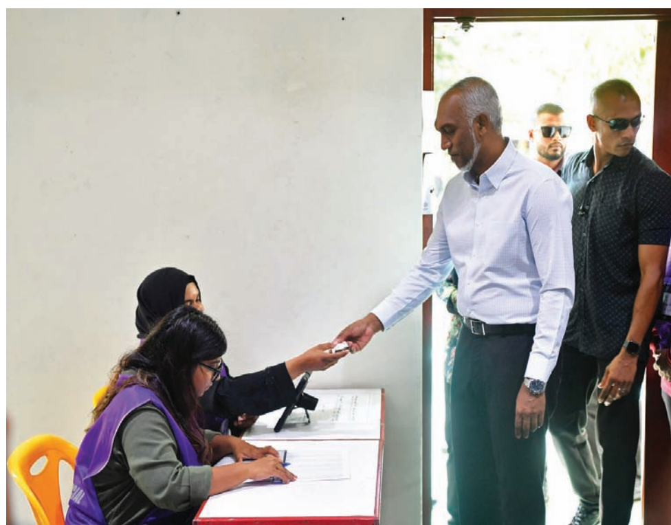
رئيس المالديف محمد مويزو لدى تصويته في مركز اقتراع بالعامية ماليه أمس

وتعد الهند الأرجيل ضمن دائرة نفوذها، لكن مع انتخاب مويزو أصبحت جزر المالديف تدور في فلك الصين، أكبر دائن أجنبي لها. ووقعت ماليه في مارس الماضي اتفاقية «مساعدة عسكرية» مع بكين تهدف إلى «تعزيز العلاقات الثنائية»، حسبما ذكرت وزارة الدفاع المالديفية.