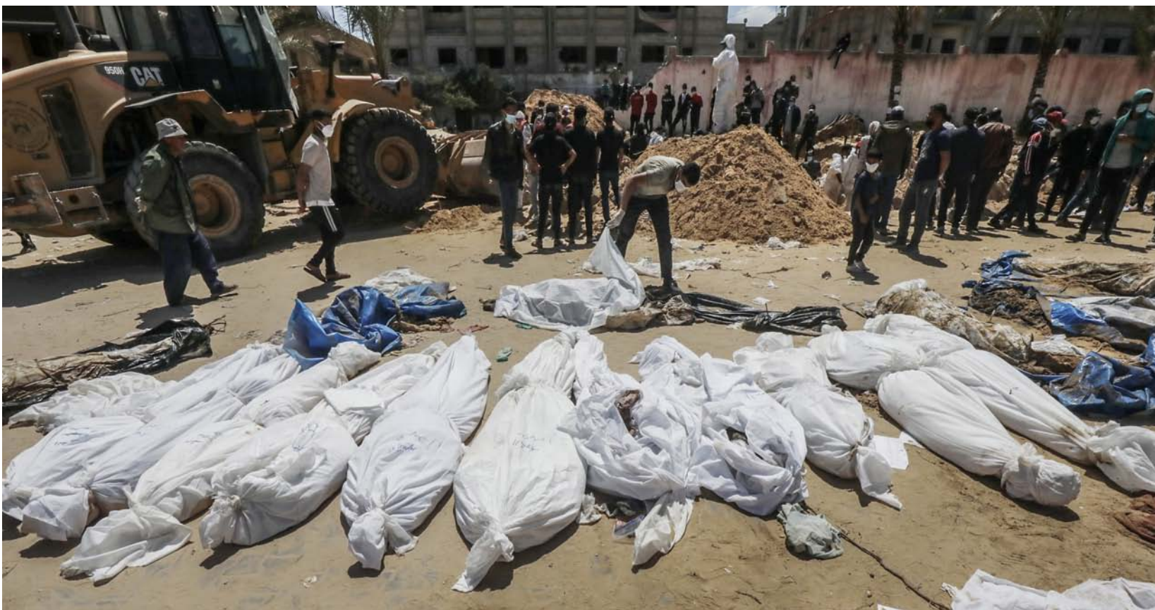
جثامين لضحايا مقبرة جماعية في خان يونس بقطاع غزة أمس

وفي مدينة خان يونس، استهدف قصف إسرائيلي خياماً تؤولي نازحين في منطقة المواصي غرب خان يونس؛ ما أدى لمقتل مواطنين اثنين وإصابة 10 آخرين.