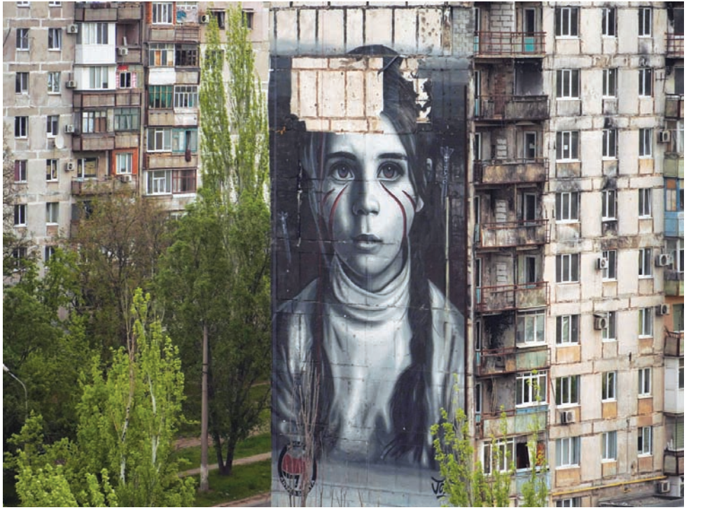
جدارية من عمل الفنان الإيطالي جوريت تظهر صورة لفتاة في مبنى سكني بباريويول الخاضعة لسيطرة روسيا

دعوة السكان ذوي الغالبية الصربية إلى التصويت لإقالة رؤساء بلديات ألبان