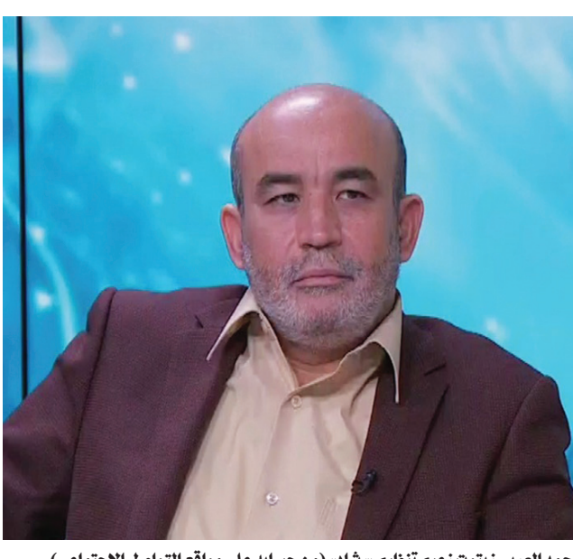
محمد العربي زيتوت زعيم تنظيم «رشاد»

سنة 2019، تطالب بالديمقراطية وبسرعة الحكم». وكانت السلطات منعت مظاهرات الحراك عام 2021، بحجة أن «تيارات اخترقته لإبعاده عن أهدافه السامية»، وكانت تشير أساساً إلى «رشاد»