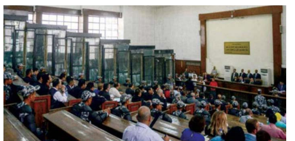
محاكمة سابقة لعناصر من «الإخوان» أدينوا بـ «الإرهاب» في مصر

قررت محكمة مصرية، يوم الأحد، إحالة أوراق 9 من عناصر تنظيم «الإخوان» إلى مفتي الديار المصرية، لأخذ الرأي الشرعي في الحكم بـ «إعدامهم». وحددت المحكمة جلسة 6 يوليو (تموز) المقبل، للنظر بالحكم في القضية. وحظرت الحكومة المصرية تنظيم «الإخوان» في ديسمبر (كانون الأول) عام 2013، وخضع مئات من قادته وأنصاره، وعلى رأسهم محمد بديع، مرشد «الإخوان»، لمحاكمات في قضايا، يتعلق معظمها بـ «التحريض على العنف»، وصدرت في بعضها أحكام بالإعدام، والسجن «المشدد» و«المؤبد».