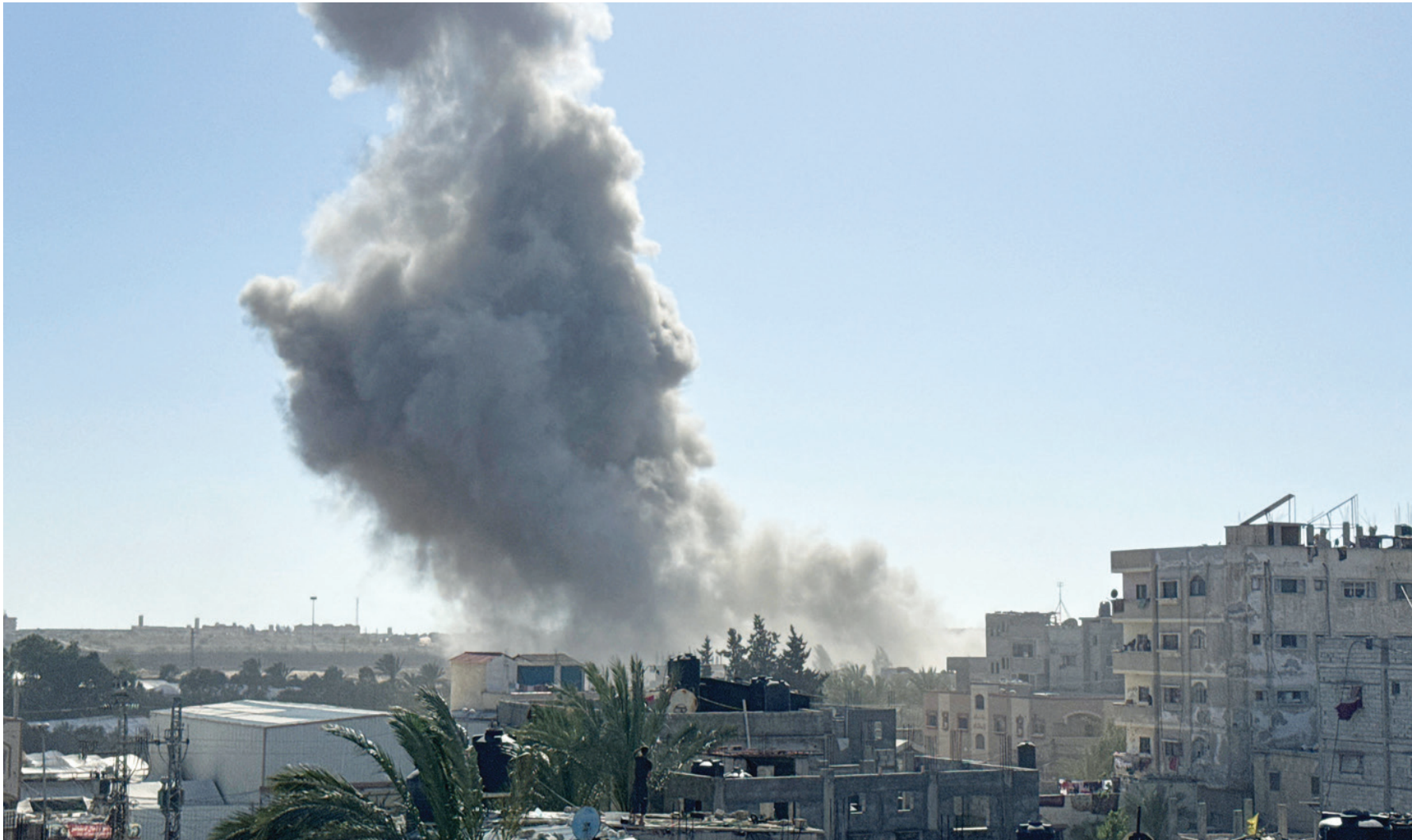
الدخان يتصاعد بعد غارة إسرائيلية أمس على رفح جنوب غزة

وأردف: «هو لا يريد أن يعود النازحون إلى شمال غزة وإلى أماكن سكنناهم، فقط يوافق على عودة متدرجة وباعداد محدودة، وهذا أيضاً لا يمكن أن يتم». واسترسل: «هو لا يريد أن يعطي الاستحقاق المطلوب لعملية التبادل ووضع أعداد بسيطة جداً، ويريد أن يتحكم بها، في حين أنه اعتقل حديثاً ما يقرب من 14 ألف فلسطيني منذ السابع من أكتوبر (تشرين الأول) من الضفة الغربية وغزة». وأكد هنية أن «المقاومة على أرض غزة في موقع القدرة على الاستمرار بالدفاع عن شعبنا، والعدو لن يستطيع كسر بتدقية المقاومة ولا خفض رايته ولا هزيمة إرادتها».