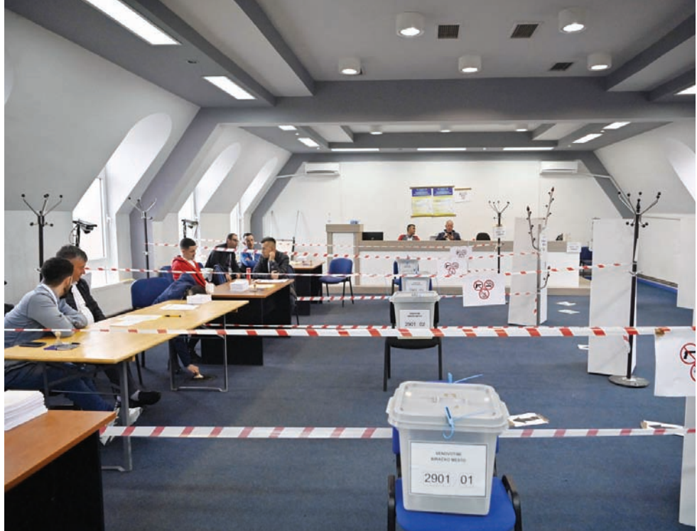
موظفو اللجنة الانتخابية يجلسون في مركز اقتراع ببلدة زفيتشان شمال كوسوفو أمس

وصرح صربي من الشمال في الثالثة والخمسين من العمر، طلب من وكالة الصحافة الفرنسية عدم الكشف عن هويته: «لن أدلي بصوتي. لا أستع إلى أعضاء سربسكا ليستا، لكن لا أرى فائدة في الأمر، ونحن ليس في سعنا استبدال رؤساء البلديات، فأعدادنا ليست كافية». يذكر أن العلاقات بين بريشينا والأقلية الصربية في شمال كوسوفو، التي تدعمها وتمولها جزئياً بلغراد، متوترة منذ إعلان الاستقلال في 2008. وفي سبتمبر (أيلول)، أثار مقتل ضابط شرطة من كوسوفو، وكشف مجموعة مدججة بالأسلحة مكونة من صرب، المخاوف مجدداً من حدوث تصعيد عنيف. وأدى حظر تداول الدينار الصربي، العملة المستخدمة في الشمال، مؤخراً إلى تفاقم الوضع.