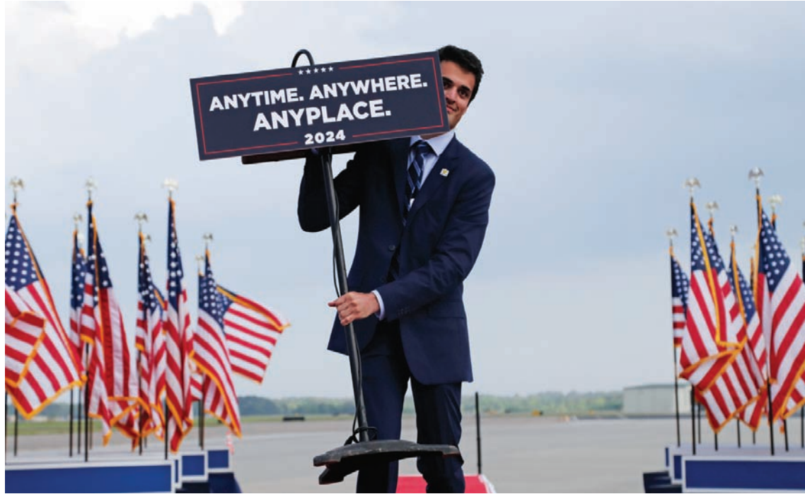
عنصر في حملة الرئيس السابق دونالد ترمب يحمل منصة تشير إلى استعداده لمناظرة الرئيس جو بايدن في أي وقت وأي مكان قبل إرجاء التجمع الانتخابي بوليمفون

ويحاكم ترمب في قضية دفع أموال لشراء صمت نجمة الأفلام الإباحية السابقة ستورمي دانيلز قبل أيام قليلة من انتخابات 2016 التي فاز فيها بفارق