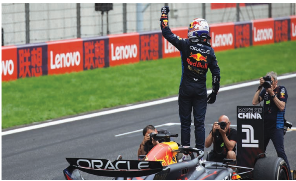
فيرستابن عند وصوله في المركز الأول على حلبة شغهاي

ورفع فيرستابن رصيده في صدارة الترتيب إلى 110 نقاط، متقدماً بفارق 25 نقطة عن بيريز، وبفارق 34 نقطة عن سائق فيراري شارل لوكلير من موناكو