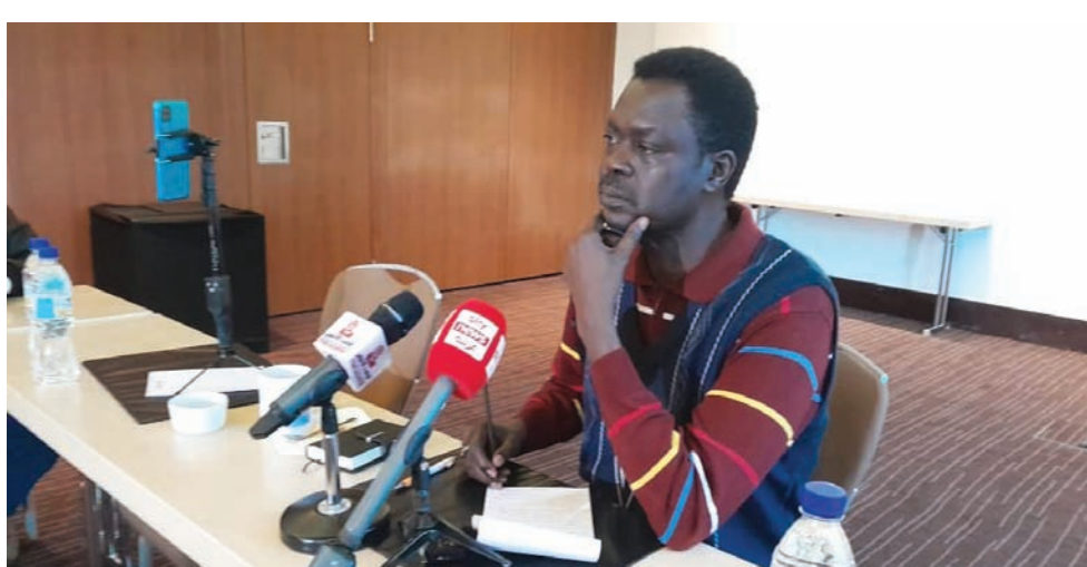
حاكم إقليم دارفور مني أركو مناوي

الجيش و«قوات الدعم السريع» في أبريل (نيسان) من العام الماضي، إلا أنها قررت لاحقاً القتال في صف الجيش ضد «الدعم السريع». وأصدر أحمد العمدة بادي، حاكم إقليم النيل الأزرق في جنوب السودان، يوم الأحد، مرسوماً بتحديد حالة الطوارئ في الإقليم لمدة ثلاثين يوماً ابتداءً من الأحد، وفق ما ذكرت «وكالة أنباء العالم العربي». ووجه المرسوم قائد الفرقة الرابعة مشاة ومدير الشرطة ومدير جهاز الأمن العام والخبرات، بالتدخل بكافة الإمكانيات المتاحة، ولهم كامل الصلاحيات الدستورية والقانونية لاتخاذ الإجراءات المناسبة حسب طبيعة الحال.