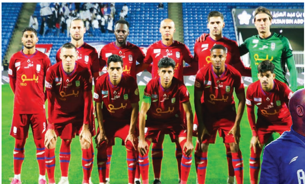
مؤشرات فريق أبها السلبية قد تقوده لهبوط (نادي أبها)

لكن فريق أبها لديه مؤشرات سلبية تقود إلى مصير قد يكون عنوانه الهبوط نحو دوري الدرجة الأولى، حيث استقبلت شبكاته حتى الآن 74 هدفاً، وهو رقم قياسي لم يعقد على تسجيله في تاريخ الدوري السعودي. استقبال هذا العدد من الأهداف حتماً سيصنع صعوبة الحفاظ على