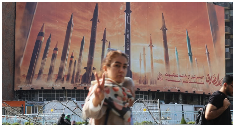
امراة غير محببة تم أمر لافتة دعائية للصواريخ الإيرانية في ساحة «ولي عصر» وسط طهران الاثنين الماضي