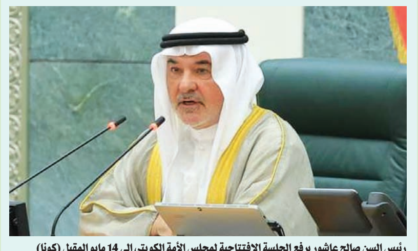
رئيس السن صالح عاشور يرفع الجلسة الافتتاحية لمجلس الأمة الكويتي إلى 14 مايو المقبل