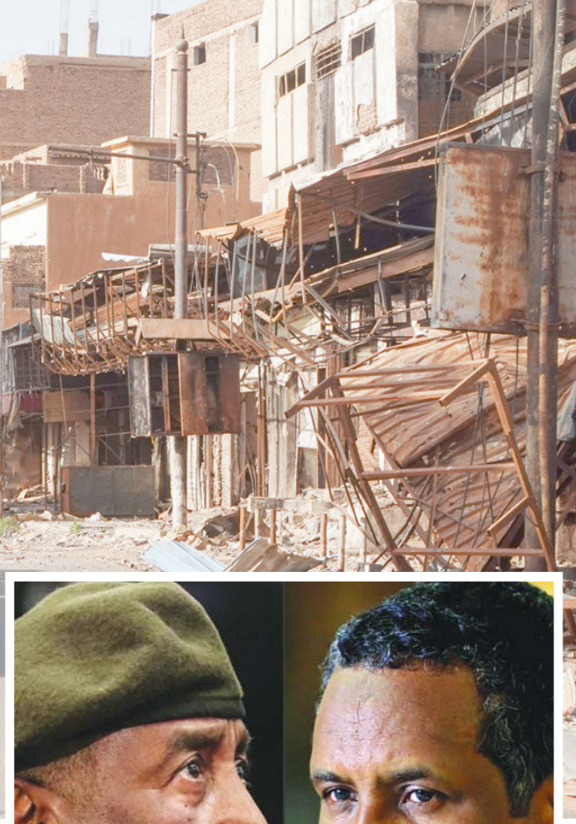
منازل متضررة جراء الحرب في العاصمة السودانية الخرطوم مطلع أبريل

وأشار الضابط، الذي فضل حجب هويته، إلى أن هذه العقيدة هي طريقة الحروب التقليدية التي تدرب عليها الجيش في القتال، وخاض بها حروباً داخلية كثيرة، وعلى وجه الخصوص الحرب التي دارت في جنوب السودان لأكثر من 4 عقود، قبل انفضائه في عام 2011. وتابع الضابط: «لكن في وقت لاحق، صلاح المدير العام لجهاز الأمن السابق، صلاح عبد الله، الشهير باسم قوش، إلى الخلل في عدم وجود قوات خاصة معنية بحرب المدن، فأنشئت فرقة للعمليات الخاصة بميزات قتالية متقدمة، كانت قد واجهت الغزو الذي