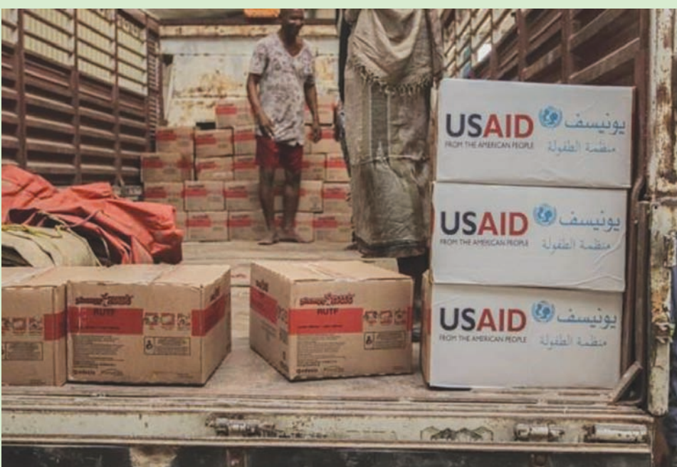
مساعدات غذائية مقدمة من الوكالة الأميركية للتنمية الدولية بالتعاون مع اليونيسيف (الأمم المتحدة)

ويعمل برنامج النمو الاقتصادي التابع للوكالة الأميركية للتنمية الدولية على تحقيق استقرار الاقتصاد الكلي في اليمن من خلال تحسين