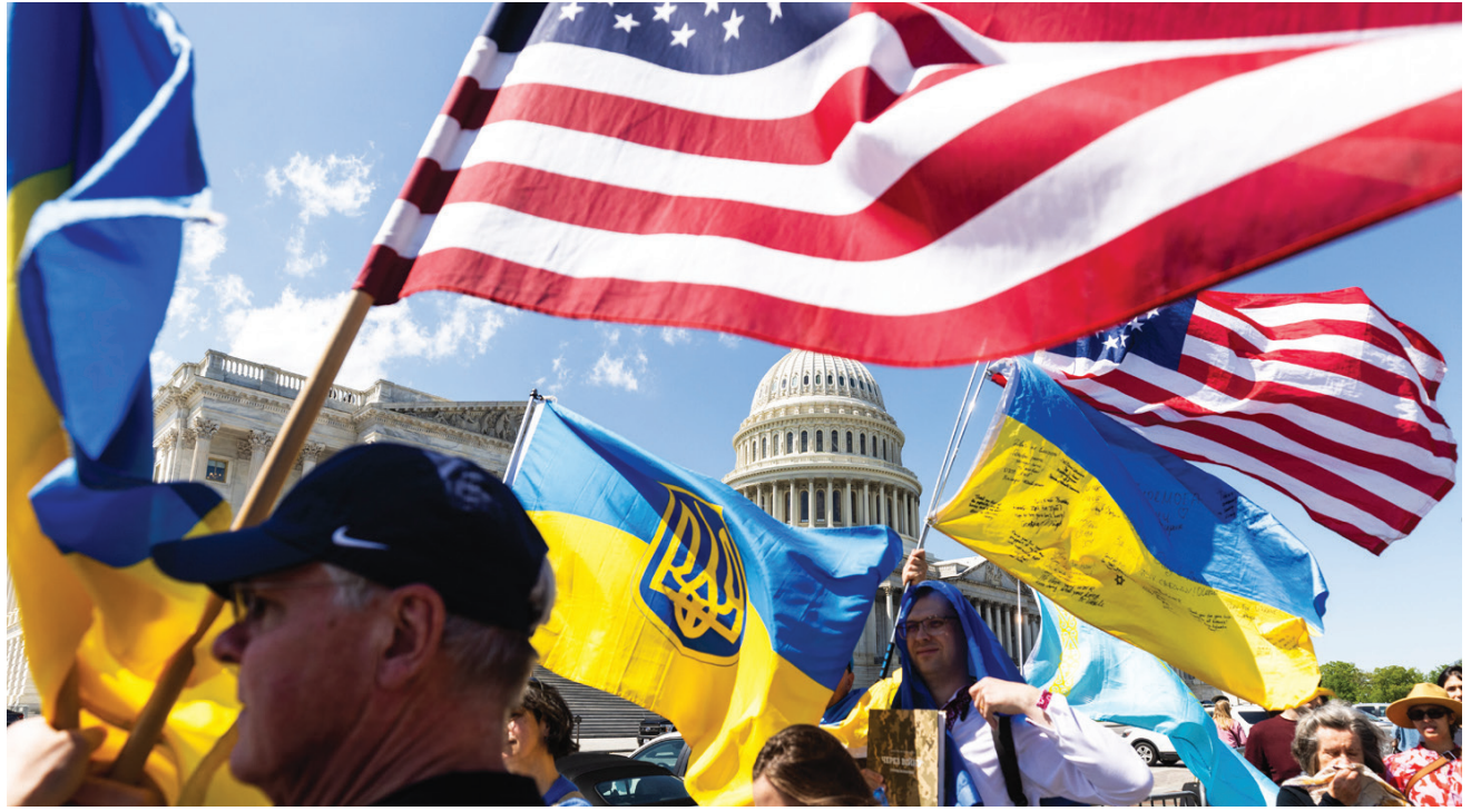
أصوات أوكرانيا بلوحون بالأعلام الأميركية والأوكرانية خارج مبنى الكابيتول بعد موافقة مجلس النواب على حزم مساعدات لأوكرانيا وكذلك لإسرائيل وتايوان

وفي روما، صرح وزير الخارجية الإيطالي أنتونيو تاياني، أمس الأحد، أن حزمة المساعدات التي اقترها مجلس النواب الأميركي لصالح أوكرانيا تشكل «منعطف حاسماً». وكتب تاياني على «إكس» أن «60 ملياراً من المساعدات الجديدة من الكونغرس الأميركي إلى أوكرانيا يشكل منعطف حاسماً. وبعد اجتماع مجموعة الدول السبع في كبري برئاسة إيطالية،