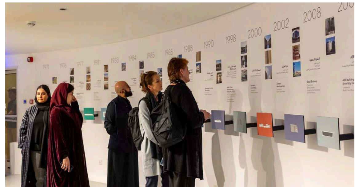
تحوّل المعرض إلى مساحة فنية عامرة بالأعمال والإبداع (فناء الأول)

«كشف»، وياخذهم في رحلة لاكتشاف الرؤيا المخفية، والتفاصيل الهندسية اللافتة للنظر من المباني التي صمّمها المهندس المعماري فانوس.