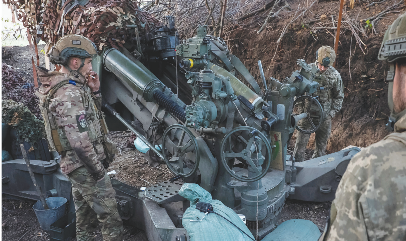
جنود أوكرانيون يتحضرون لإطلاق النار من مدفع «هاوتزر M177» باتجاه القوات الروسية في دونيتسك

وفي مواجهة استراتيجية موسكو هذه، واصلت كريف طلب الذخائر والأنظمة المضادة للطائرات من شركائها في الأسابيع الأخيرة