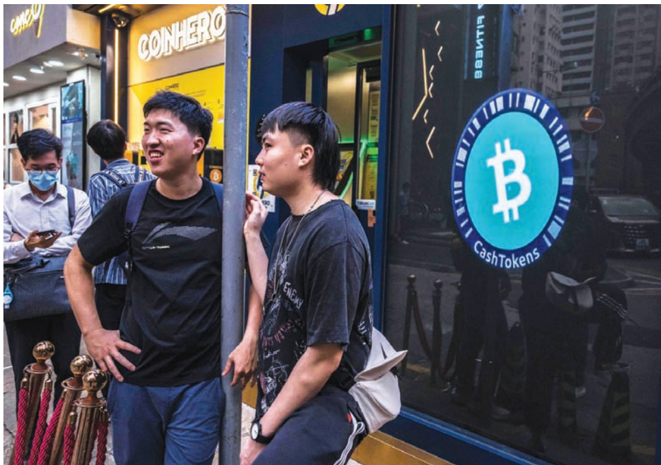
شباب يقفون بالقرب من بورصة العملات المشفرة في هونغ كونغ

المحامي المقيم في ميامي والمتخصص في الأصول الرقمية في شركة «هولاند أند نايت»: «حتى لو كانت هناك زيادة طفيفة في سعر البيتكوين، فإن التخليص إلى النصف يمكن أن يؤثر حقاً على قدرة القائم بالتعدين على دفع الفواتير. لا يمكنك أن تفرض أن عملة البيتكوين ستذهب إلى القمر. وبيعاً عابراً نموذج عملك، عليك التخطيط للتقلبات الشديدة».