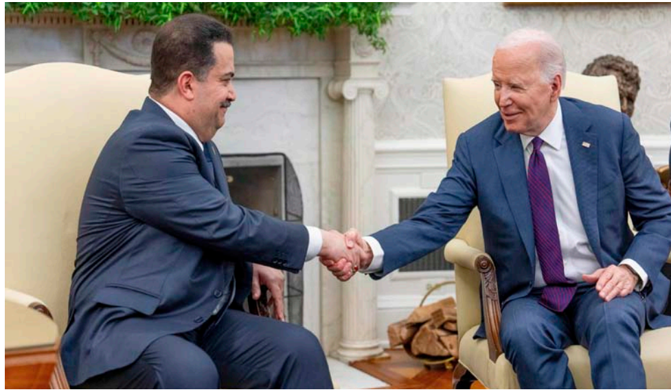
الرئيس الأميركي جو بايدن يصادف رئيس الوزراء العراقي محمد شياع السوداني في مستهل لقاء ثنائي بالمكتب البيضاوي في البيت الأبيض

الإطارية الاستراتيجية للتعاون بين البلدين، من أهم المذكرات التي سيتم التوقيع عليها؛ إذ تتفرع منها 5 لجان، وهي: الأمنية، والمياه، والاقتصادية، والطاقة، والنقل. وكان السفير العراقي في أنقرة، ماجد اللجموي، قد أكد من جانبه أن زيارة الرئيس التركي رجب طيب أردوغان إلى بغداد ستساهم في حل الملفات العالقة بين البلدين، وستشهد توقيع اتفاقية إطارية استراتيجية. وقال في بيان إن «الزيارة ستحقق قفزة نوعية شاملة في علاقات التعاون بين العراق وتركيا»، مضيفاً أنها ستشهد توقيع اتفاقية إطارية استراتيجية جرى العمل عليها في الأشهر الأخيرة، تتناول المجالات الأمنية، والاقتصادية، والتنموية، وإحراز تقدم في ملفي المياه والطاقة، وكذلك عملية استئناف تصدير النفط العراقي عبر تركيا. وأشار إلى أن زيارة الرئيس التركي تاتي في إطار سعي البلدين إلى تعزيز