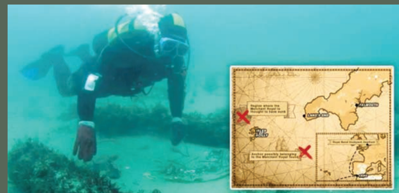
يرقد حطام السفينة قبالة سواحل كورنوال البريطانية (سوانز)

كبيرة من الذهب ويصحبون أثرياء بن عشية وضحاها»، وأصبحت من الماضي. ويقول إن الإغراء بالنسبة له يكمن في العثور على إجابات؛ لأن العثور على حمولة ثمينة قد يتحول إلى قطع أثرية من التراث.