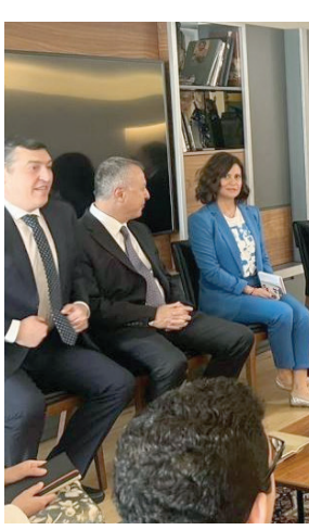
لم يحصل التوافق، لانتخاب المرشح الأقوى».

وفي حين بلغت إلى أن الخلاف حيال المبادرة التي قدمها «التكتل» يركّز على نقطتين أساسيتين، هما من يدعو للحوار ومن يتراسه، ينسب إلى أن مستوى التنسيق سيرتفع في المرحلة المقبلة بينهم وبين السفرء، ويكشف أنهم طرحوا التعديل في النقطتين الخلافيتين، عبر اقتراح أن يتداعى النواب للقاء لكنه يُعقد برئاسة رئيس البرلمان، أي لا يدعو