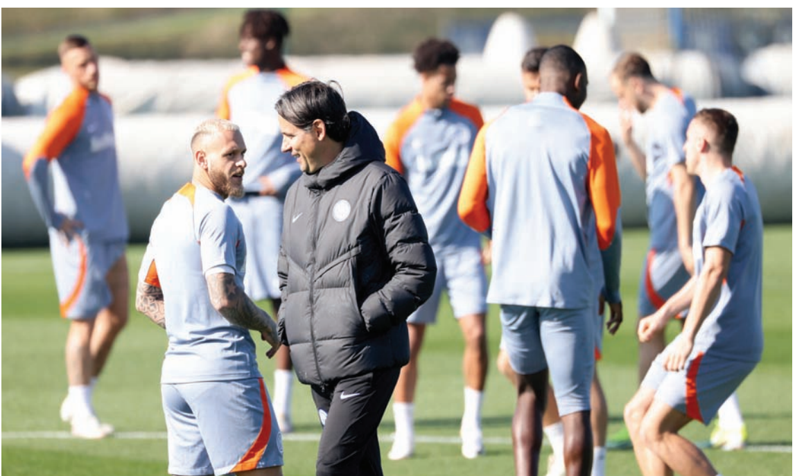
إنزاغي يتطلع للتتويج بلقب الدوري الأول له بوصفه مدرباً مع إنتر في مواجهة ميلان

بدوره، يحاول ماكسيميليانو بيرغري مدرب يوفنتوس الثالث تأمين مكانه في المربع الذهبي عندما يلقي مضيئه كالياري الرابع عشر اليوم (الجمعة). وأمام يوفنتوس فرصة جيدة لإنقاذ موسمه والخروج بلبق من خلال التتويج بكأس إيطاليا، حيث إنه مدعو لمواجهة