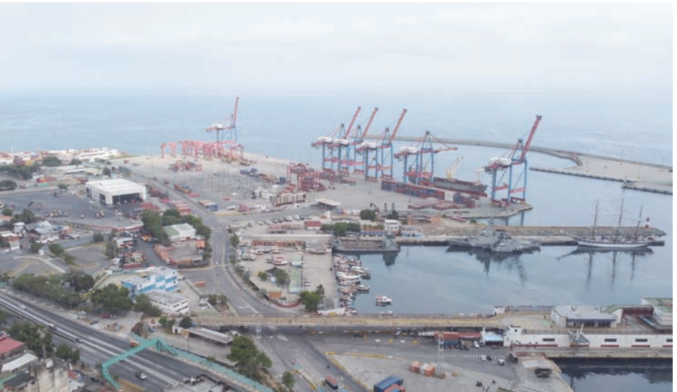
ميناء بوليفار يانا دي بويرتو لا غويرا في لا غويرا بفنزويلا

الراسمالية الكبرى اللازمة لإنعاش الإنتاج الرائد منذ فترة طويلة في فنزويلا، التي تقع على قمة أكبر احتياطات نفطية مؤكدة في العالم. ومع ذلك، من خلال السماح لفنزويلا بإرسال النفط مباشرة، بدلاً من المرور عبر وسطاء مشهورين يتقاضون رسوماً باهظة، تمكنت حكومة مادورو من تعزيز عائدات النفط وجمع الأموال التي كانت في أمس الحاجة إليها خلال الأشهر الستة من تخفيف العقوبات الأميركية.