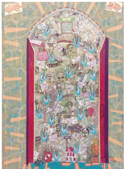
«الحرب الأهلية، لوحة تروي كل الحكاية (رينالدو)

تبدأ هذه الحكايات من مطارح عدة، مثل بوابة السفارة الإسبانية في لبنان. من هناك يروي قصة حروب لبنانية، ومن أخرى تعود لمقطوعة موسيقية «كونشيرتو دي أرانجوز»، يذكرنا بصوت فيروز. وفي ثالثة يعثر صايغ إلى تاريخ الموانئ من باب كاتدرائية سانتا ماريا الإسبانية، ومن ثم يحط رحاله في محطات أخرى، مثل الهجرة وطريق الحرير واللغة الفينيقية الأم، ومن أبواب إسبانية في غرناطة وبرشلونة وتوليدو وغيرها، يطل على موضوعات أكثر تشعباً وثراءً. يتنقل بين عبارات دمج اللبانية بالإسبانية. ويعرج على التمازج بين الأندلس والإسلام. ويحتج قصصاً عن الفيلسوف الإسباني سيرفانتس وجبران خليل جبران.