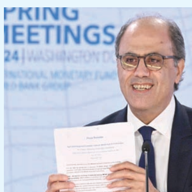
أزور أثناء عرضه التقرير

استمرار الصراعات في الكثير من اقتصادات منطقة الشرق الأوسط وشمال أفريقيا.