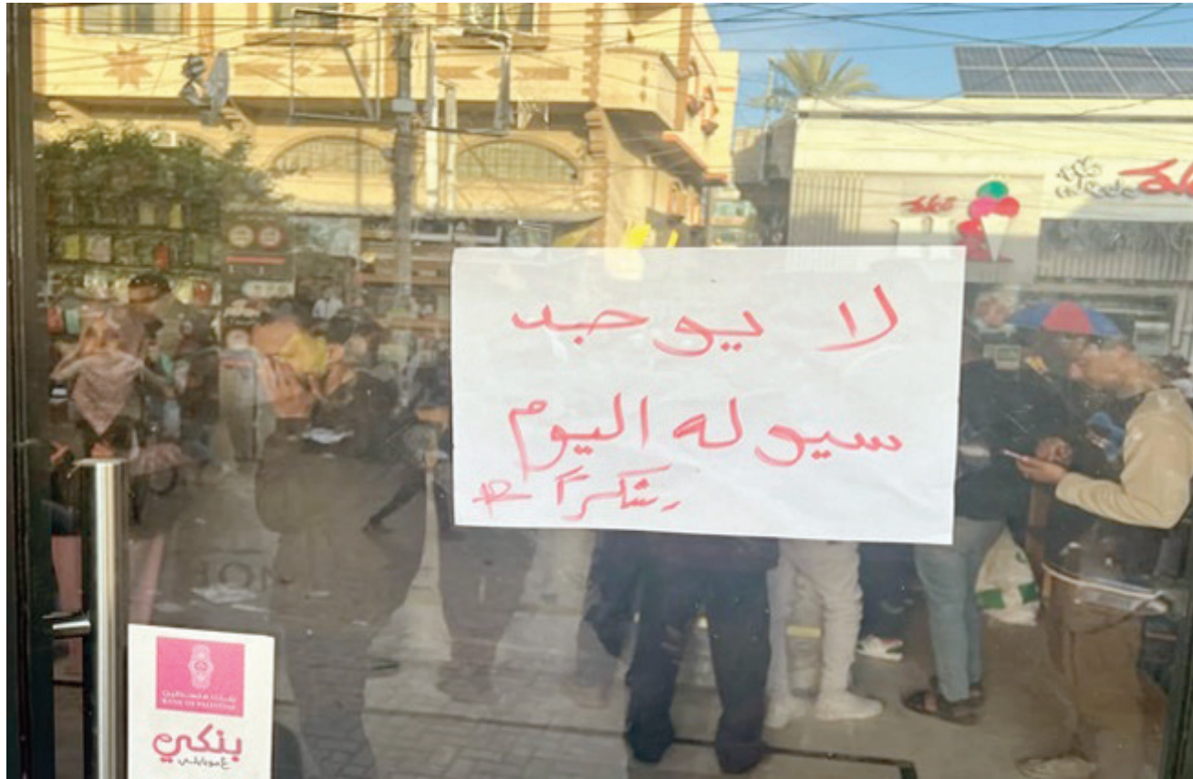
صورة متداولة على مواقع التواصل لمكتب صيرفة في غزة