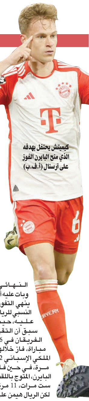
كيمييتش يحتفل بهدفه الذي منح البايرن الفوز على أرسنال

عقلانية أنشيلوتي رجحت كفته على حماس غوارديولا في قمة الريال وسيتي... والبايرن ودورتموند يتعشمون بنهائي ألماني