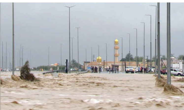
سجّلت عُمان أرقاماً قياسية في حجم الأمطار (العمانية)