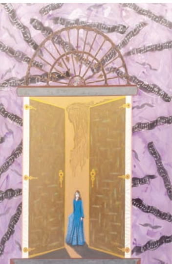
فيروز أيقونة فنية على باب إسباني (رينالدو)