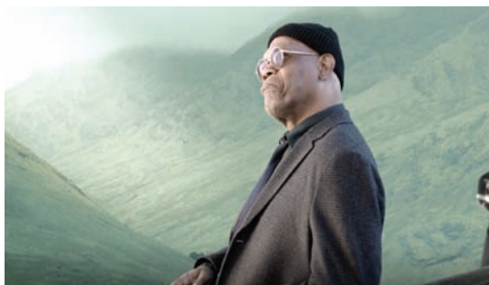
سامويل ل. جاكسون في «متضرر»

★★ STING إخراج: كيانا واشر-تيرنر رعب الولايات المتحدة 2024