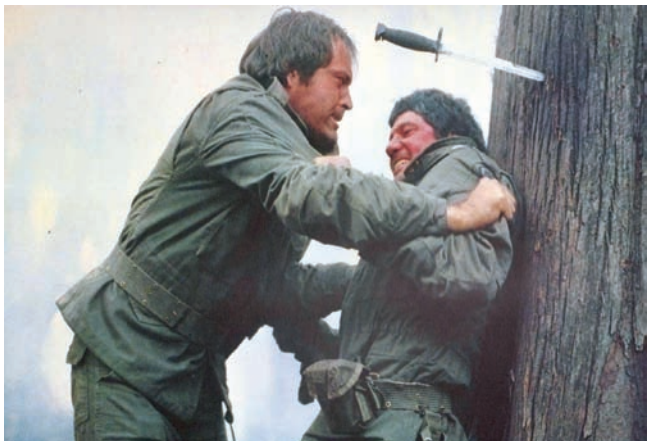
«رفاهية جنوبية»، (سينما عُروب فنتشنز)

ومن ثَمَّ هناك ذلك الفيلم «رفاهية جنوبية» (Southern Comforts) لوالتر هيل (1981) فيلم حديث (ليس وسترن) يحفز عن فرقة من جنود الحرس الوطني يُنقلون إلى ولاية لويزيانا الجنوبية في مهمة تدريبية؛ ينادهم لا تحمل ذخيرة حية، ويجدون أنفسهم مكرهين في مواجهة أبناء الجنوب. فيلم منسي اليوم، لكنه من بين أفضل ما حققه ذلك المخرج وما تحقق في تلك الفترة، وهو نظام خفية لموضوع الحرب التي لا تنطوي.