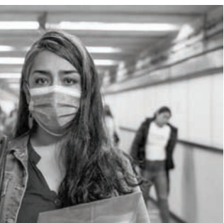
تجوية رجل ميت» (مهرجان فريبورغ)

في أحد المشاهد تدخل داليا غرفة المراقبة الأمنية. مثنو المشاهدات