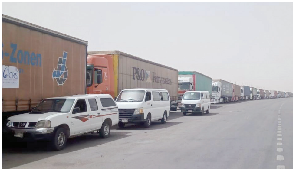
شاحنات مساعدات إنسانية مصرية في طريقها إلى قطاع غزة عبر معبر رفح

وأكد مدبولي، خلال اجتماع الحكومة المصرية في مقرها بالعاصمة الإدارية (شرق القاهرة)، الخميس، أن «هناك تنسيقات تتم على مدار اليوم مع مختلف الأطراف». وتقوم مصر، إلى جانب الولايات المتحدة وقطر، بدور الوسيط في مفاوضات غير مباشرة تستهدف الاتفاق على «هدنة» في