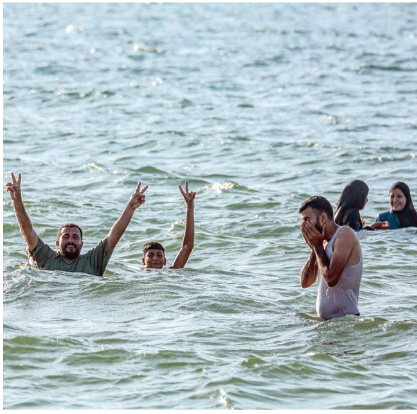
أهل غزة يقولون «البحر متفتنا» بعيداً عن خيم النزوح