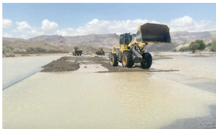
فوق الإنقاذ العمانية تواصل فتح الطرق (العمانية)