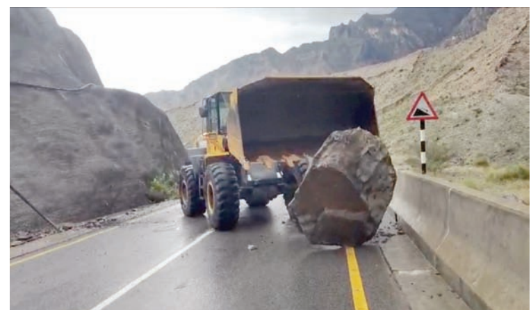
تكثيف الجهود لإزالة الصخور وفتح الطرق في عمان