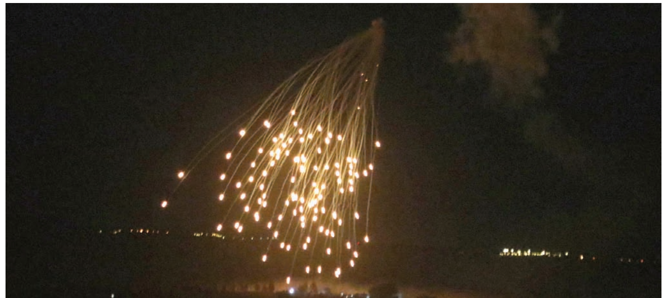
غارة إسرائيلية تضئ السماء فوق بلدة الخيام في جنوب لبنان ليل الأربعاء (أ.ف.ب)