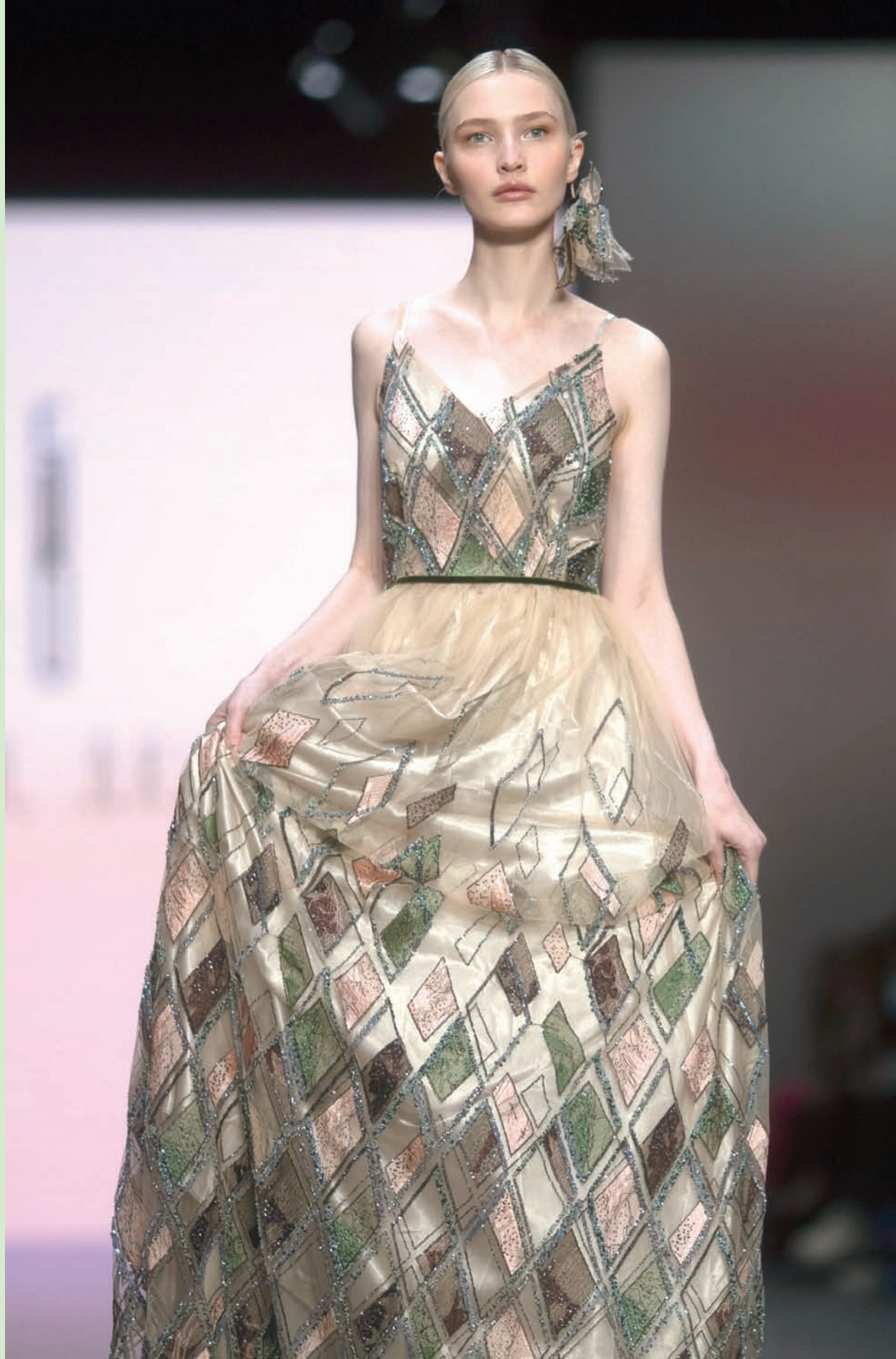
عارضة تتقدم تصميماً من مجموعة «سيرينا برايدل» ضمن أسبوع أزياء الزفاف في برشلونة بإسبانيا