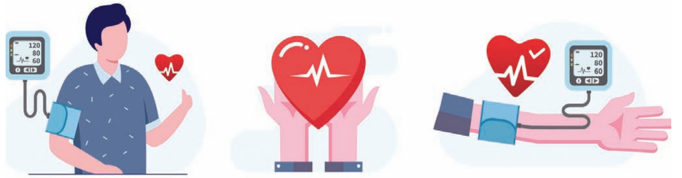
مقياس ضغط الدم