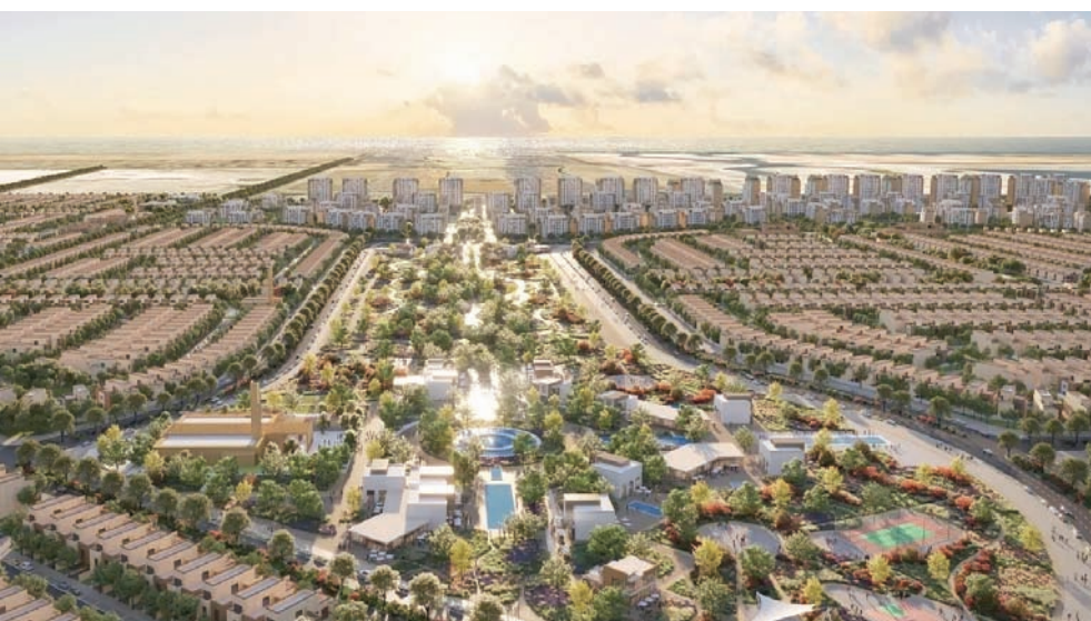
توقع استمرار المؤشرات الإيجابية لقطاع العقار في السعودية وسط ترقب خفض الفائدة