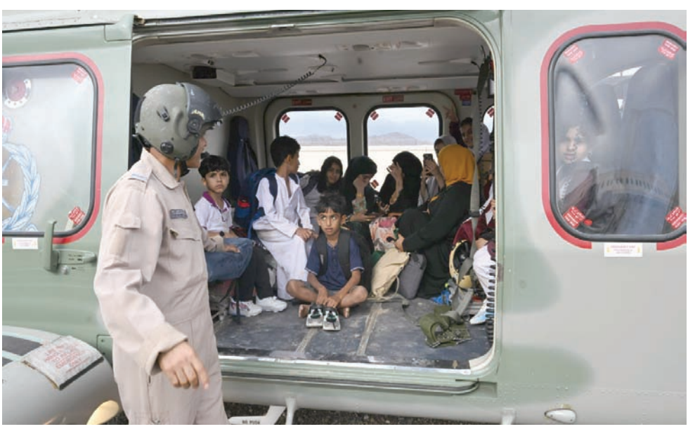
تسبب المنخفض في سقوط ضحايا

وأشار التقرير إلى أنه من الممكن أن يؤدي التغير المناخي إلى ارتفاع درجات الحرارة وزيادة شدة حالات الجفاف وتواترها، بحيث تؤثر في