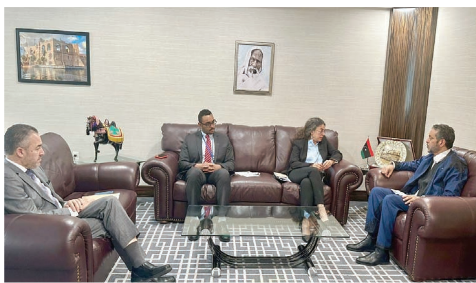
لقاء سابق يجمع ستيفاني خوري ومندوب ليبيا لدى الأمم المتحدة

عبد الحميد الدبيبة. وأمام مخاوف من تزايد التوتر والعودة للاقتتال في غرب البلاد، يتساءل الليبيون عن أسباب دخول فرقاطة روسية محملة بالأسلحة والمعدات العسكرية إلى ميناء الحريقة بشرق ليبيا، ثم خروج هذا العتاد إلى دولة أفريقية مجاورة، وفق وسائل إعلام محلية. ولم تعلق القيادة العامة لـ«الجيش الوطني» الليبي، برئاسة المشير خليفة حفتر، على هذه الأنباء، لكن مصدرًا عسكريًا بـ«ليبيا» قال لـ«الشرق الأوسط» إن هذه التحركات الروسية والهدف باليات وأسلحة وحجود تأتي في إطار «الغيبق الأفرقي» الذي تستهدف منه موسكو زيادة نفوذها داخل دول أفريقية مجاورة لليبيا.