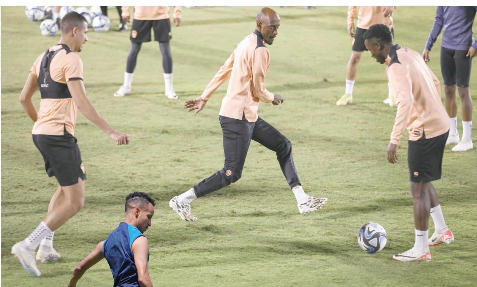
من استعدادات الفيحاء للمواجهة (الفيحاء)

في سياق الدوري السعودي للمحترفين يتتعد النصر عن المتصدر الهلال بفارق 12 نقطة مع تبقي سبع جولات على نهاية المنافسة، إذ يحضر في المركز الثاني برصيد 65 نقطة مقابل 77 نقطة لفريق الهلال المنفرد بالصدارة، والذي بات على بُعد خطوات قليلة من إعلان تتويجه باللقب رسمياً. مستويات النصر الأخيرة أظهرت تفوقاً ملحوظاً عما كان عليه الفريق، خاصة في الجانب