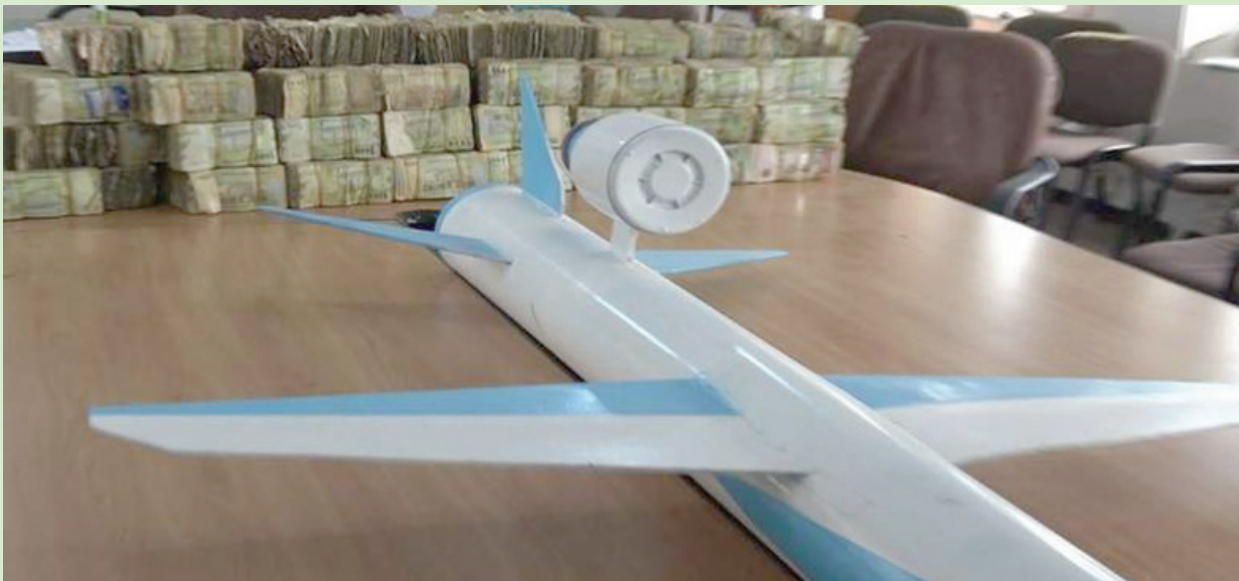
الجماعة الحوثية سخرت الموارد والأموال لتعبئة العسكرية على حساب ملايين الجوعى

ومنذ تدخل الولايات المتحدة عسكرياً، نفذت أكثر من 400 غارة على الأرض ابتداءً من 12 يناير الماضي لتجديد قدرات الحوثيين العسكرية، أو لمنع هجمات بحرية وشيكة. وشاركتها بريطانيا في 4