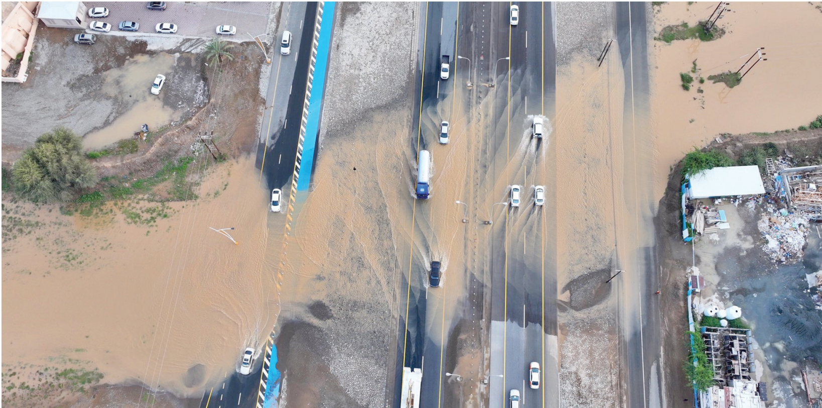
تواصل دول خليجية مسح الأضرار وتعويض المتضررين