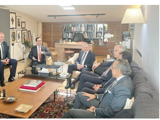
لقاء جمع السفرء مع رئيس «التيار الوطني الحر» النائب جبران باسيل

وبعد الظهر، استضاف السفير المصري علاء موسى، جميع سفرء، في لقاء تشاوري حول أهم مخارجات اللقاءات مع القوى السياسية