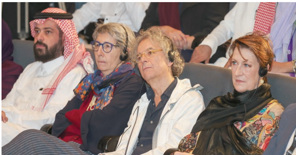
«زرقاء اليمامة» تجمع المواهب السعودية بتلك العالمية

«برع من خلال موهبته وبحثه المتعمق في الموروث العربي، بتقديم نص لائق بحجم تطلمات الجمهور لأول أوبرا سعودية بطابع عالمي»، مشيداً أيضاً بقائد الفرقة الموسيقية الموسيقار الإسباني بابلو غونزاليز، الذي «أدار المهنة بنجاح مع فرقة (درسدن) من (سميفونيك أوركسترا)، وفريق