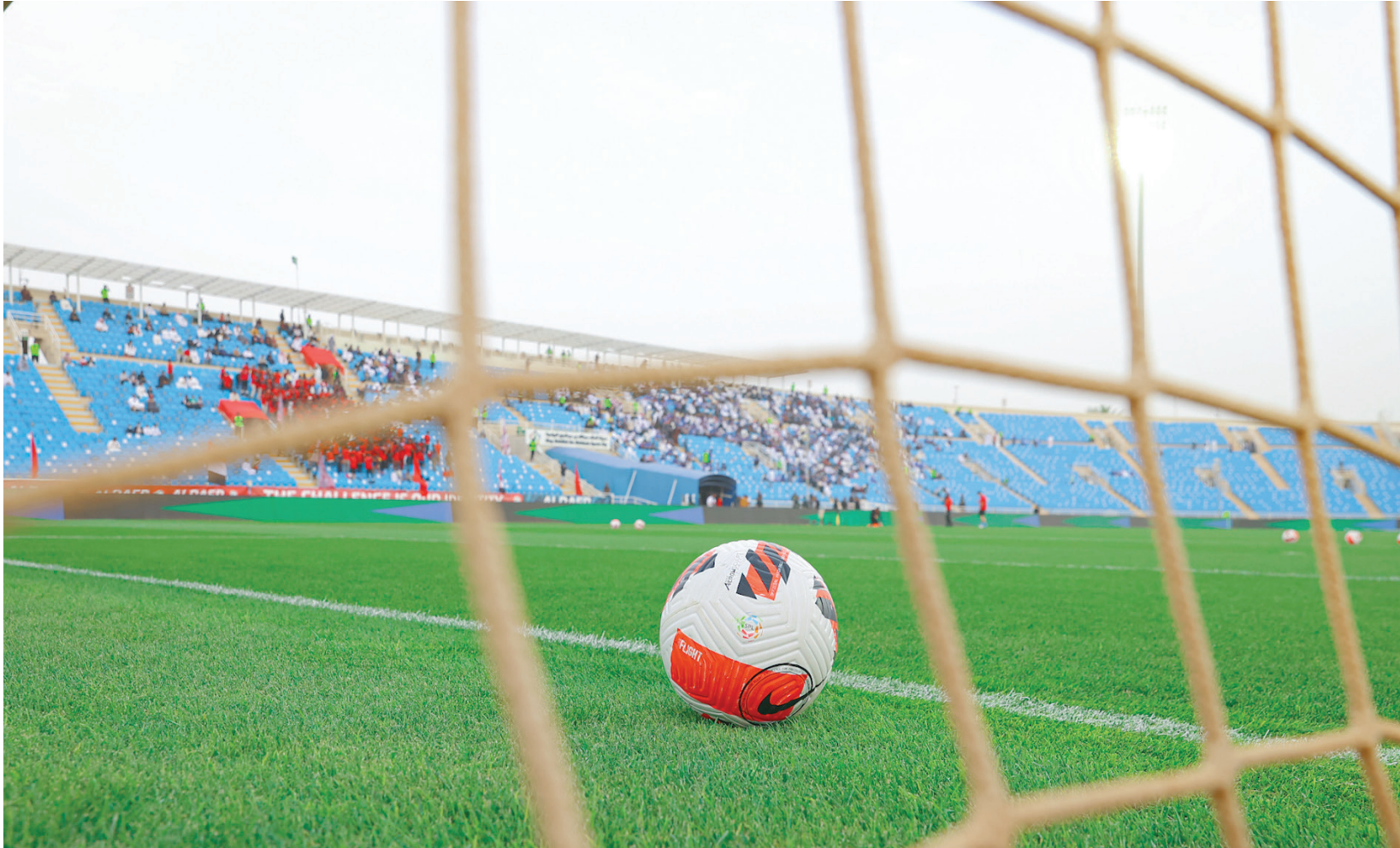
ثلاثة أندية اتهمت الرابطة بالتناقض في قضية تأجيل المباريات (الشرق الأوسط)

يذكر أن الموسم الحالي شهد تأجيل مباراة الطائي وضيئه الاتحاد في الجولة 19 من تاريخ 30 ديسمبر (كانون الأول) حتى السابع من شهر فبراير (شباط) الماضي، وذلك بسبب ظروف الطيران التي كانت عائقاً في سفر الفريق إلى مدينة حائل، كما سبق لإدارة المسابقات أن قامت بتعديل مواعيد انطلاق مباريات الهلال والوحد، والفتح والشباب في الجولة 17، إذ تقرر أن تنطلق هاتان المواجهتان في السادسة مساءً عوضاً عن التاسعة مساءً، بسبب استضافة السعودية كأس العالم للأندية، ولذا السبب تم تقديم مباراة النصر والاتفاق في الجولة 18.