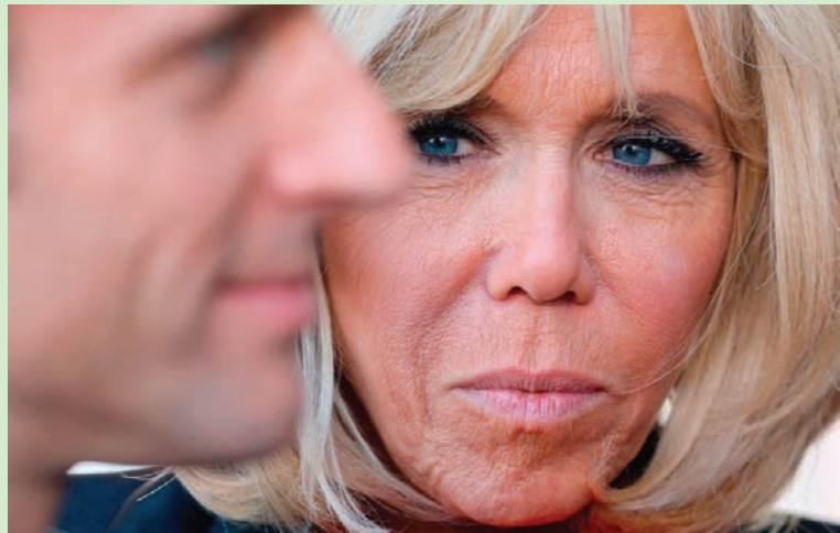
سيرة شقيقة تستميل صنّاع المسلسلات (أ.ب.ب)

في كتابة مسلسلات بوليسية من إنتاج القناة التلفزيونية الثانية. وفور صدور بيان الشركة، أعلنت أوساط السيدة الأولى أن لا علاقة لها بهذا المسلسل. وهو يبدأ من اللقاء الأول بينها، مدرّسة اللغة الفرنسية في إحدى ثانويات مدينة أميان، وبين تلميذها المراهق المتفوق أثناء تدريب مسرحي جرى عام 1992، ثم تستمر الأحداث حتى الفقرة الراهنة. وفي تصريح لصحيفة «لو فيغارو»،