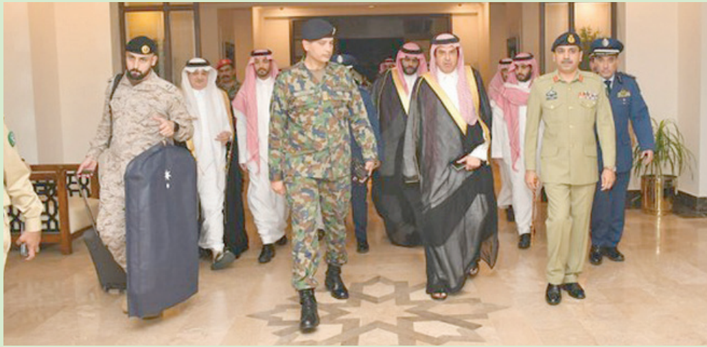
جانب من وصول مساعد وزير الدفاع السعودي إلى باكستان

باكستان، وزير الدفاع السعودي، التعاون الأمني والاستراتيجي بين البلدين، كما استعرض الجانبان سبل تعزيز علاقات التعاون المتينة في عدد من المجالات، بالإضافة إلى مناقشة تكثيف التعاون الأمني والاستراتيجي بين البلدين، بما يسهم في الأمن والسلم الدوليين، وفقاً لوكالة الأنباء السعودية (واس).