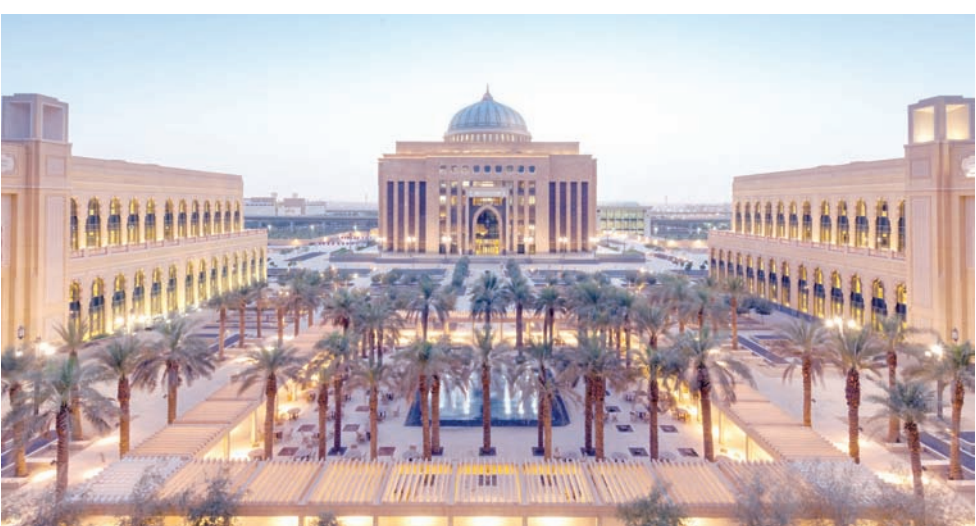
جامعة الأميرة نورة

ودعا «علمي» وجامعة الأميرة نورة المهتمين في دراسات المتاحف، للتسجيل والاستفادة من برنامج الدورات