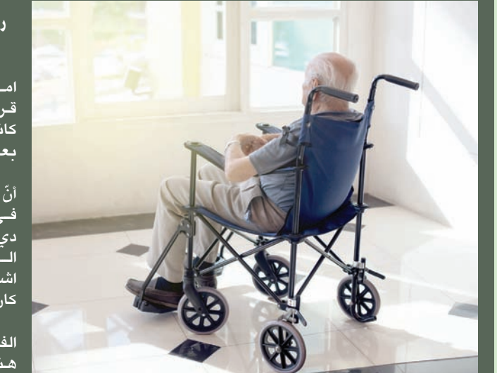
رجل على كرسي متحرك