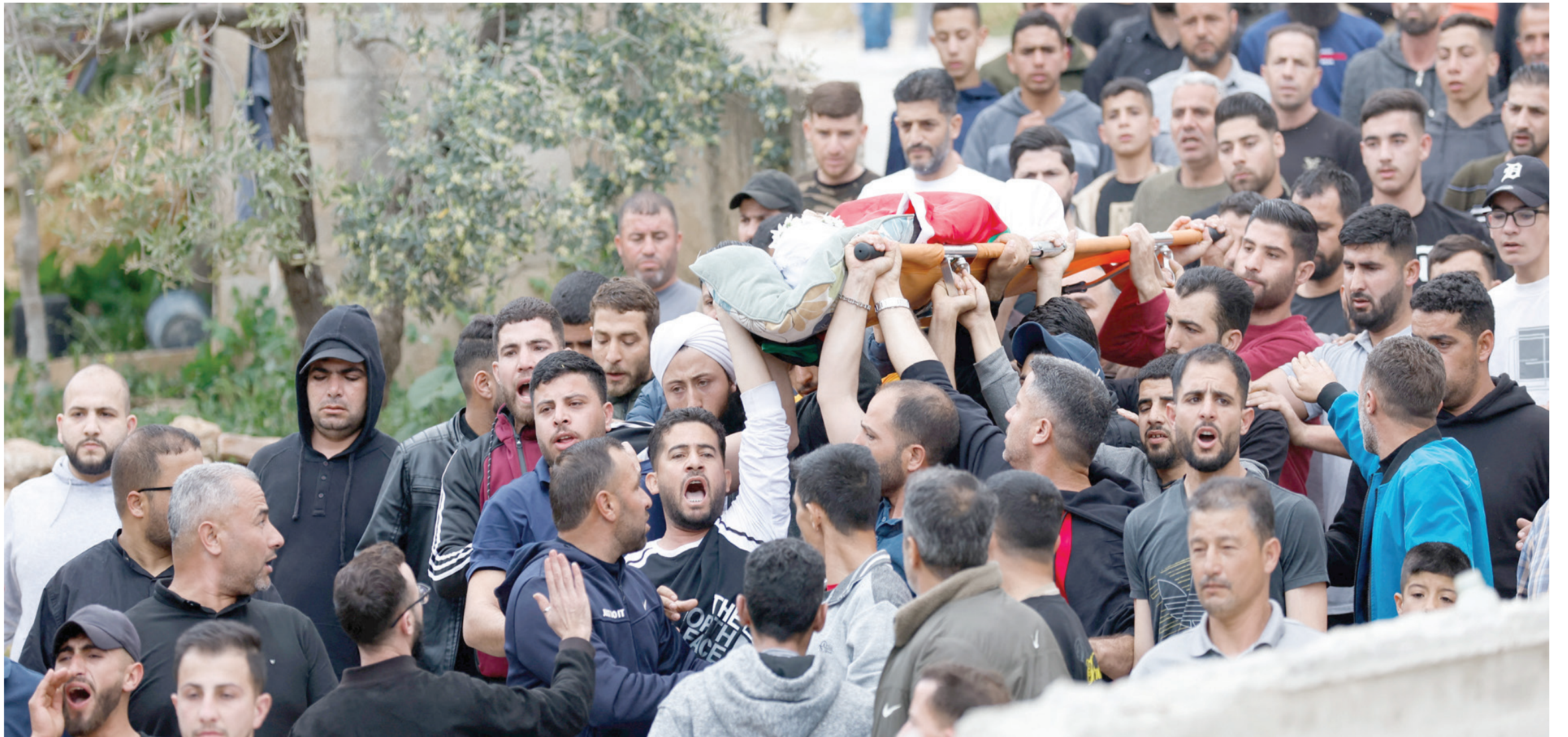
تشجيع جثمان شاب فلسطيني قُتل بهجوم لمستوطنين على قرية المغير بالضفة الغربية في 13 أبريل الحالي