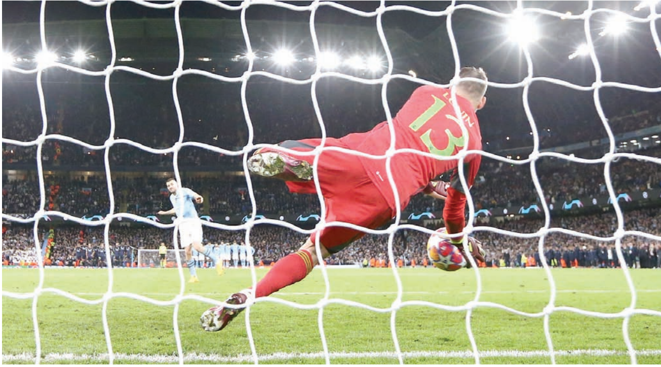
لوفين حارس الريال يتصدى بنجاح للركلة التي سدها كوفاتشيتش لاعب سيتي

وتقدم ريال مدريد عبر المهاجم البرازيلي رودريغو ثم تماشك فاعياً لمقاومة الضغط الشرس من فريق المدرب الإسباني جوسيب غوارديولا