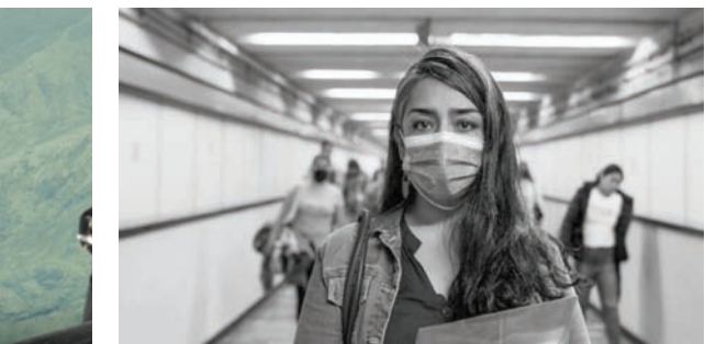
تجوية رجل ميت» (مهرجان فريبورغ)

إخراج: توي ماكدونا أشويق بوليسي الولايات المتحدة 2024