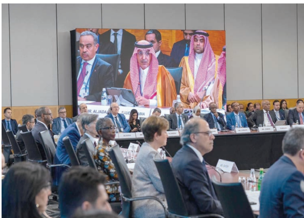
الجدعان مشاركا في اجتماع وزراء مالية ومحافظي الشرق الأوسط وشمال أفريقيا وأفغانستان وباكستان في واشنطن

نمو ملحوظ في الصادرات الخدمية، خاصة إنفاق السياح الوافدين، مما يدعم النمو الاقتصادي.