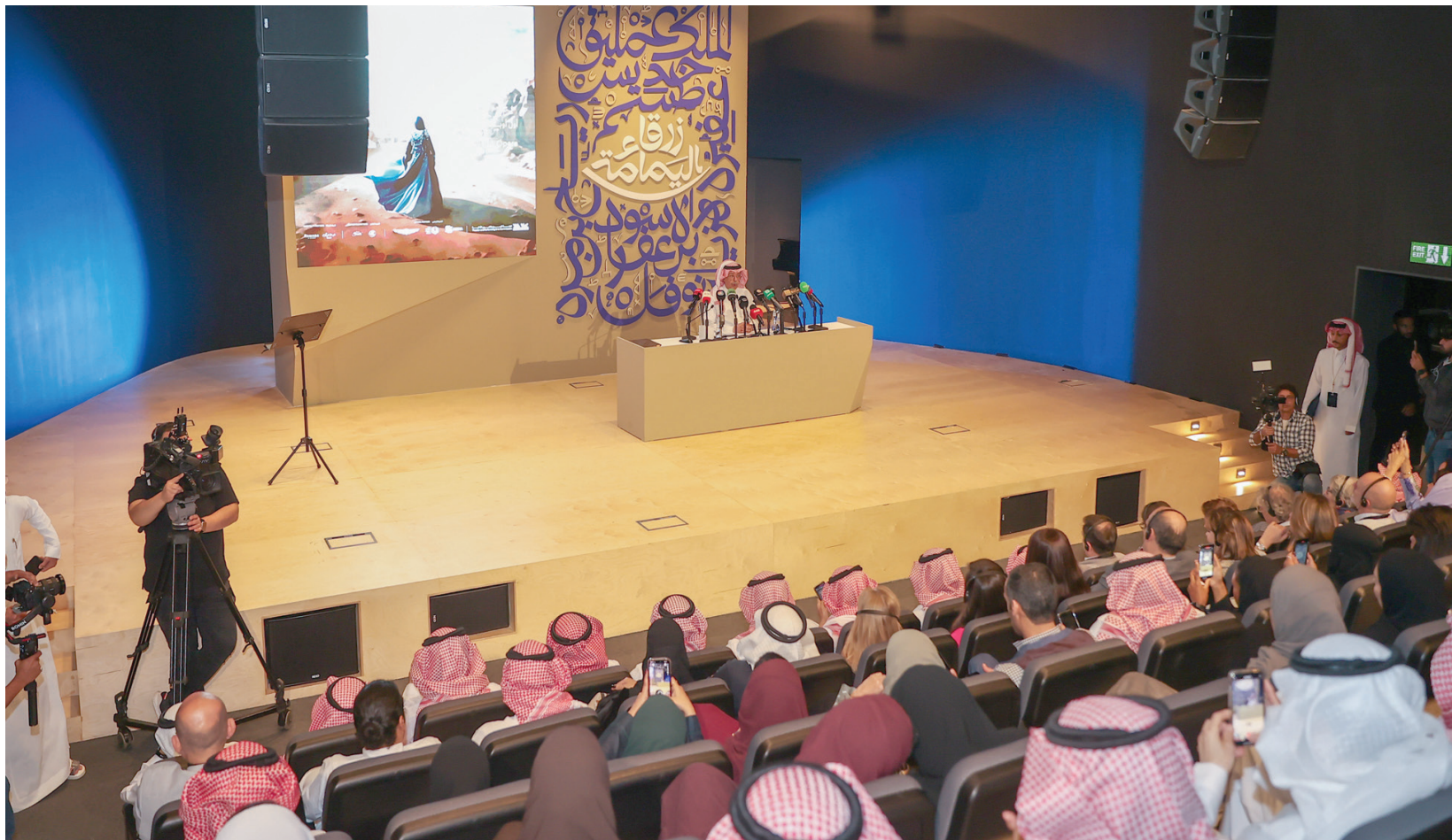
مؤتمر صحفي في الرياض للكشف عن تفاصيل العمل