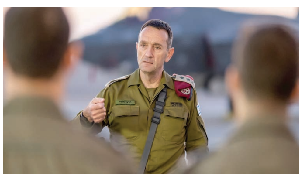
رئيس أركان الجيش الإسرائيلي هرتسي هاليفي خلال زيارته قاعدة نيفاتيم الجوية أمس

في الوقت الذي يواجه فيه وزير المالية والوزير في وزارة الدفاع، بتسليل سموتريتش، رئيس حزب الصهيونية الدينية، أزمة سياسية وشخصية كبيرة، تهدد مستقبله السياسي، خرج بحملة ضد الجيش الإسرائيلي وقيادته وراح يضرها في «المقتل»، أي الميزانية الضخمة. وأعلن سموتريتش معارضته المصادقة على شراء إسرائيل سربي طائرات من طراز «F35» و«F15» والكثير من العتاد والذخيرة، التي يطالب بها الجيش، في ظل الحرب على غزة. وقال سموتريتش لإذاعة الجيش الإسرائيلي: «أعطينا الجيش شيكاً مفتوحاً واعتمدنا بشكل أعمى عليه وعلى سائر أجهزة الأمن، وحصلنا على هجوم (حماس) في 7 أكتوبر (تشرين الأول). لقد توقفت عن الاعتماد على الجيش. أنا أحبهم، وأقدرهم، وأدعمهم، لكنني لست مستعداً لإعطائهم شيكاً مفتوحاً». وأضاف سموتريتش أن «جهاز الأمن عالق في مكان ما في 6 أكتوبر، ويرفض البحث أين أخطأنا في بناء القوة، إذاً فذلك المفهوم حول جيش صغير ومتطور قد انهار». وتابع أنه «هل نتوقع أن يعطي مواطنو