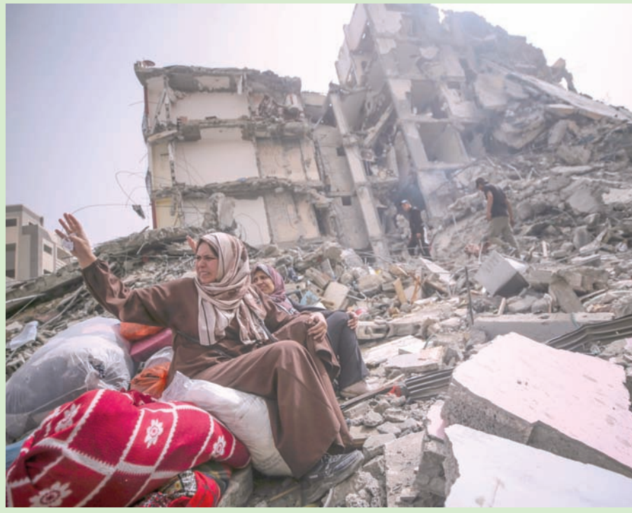
أمرأتان تجلسان وسط الركام بعد عودتهما إلى «مخيم النصيرات» بعد انسحاب الجيش الإسرائيلي وسط قطاع غزة أمس

للصوت على العضوية الكاملة لدولة فلسطين، وسط توقعات باستخدام واشنطن حق النقض. وفي الأثناء، تزايد ضغط «حزب الله» العسكري، رافعا وتيرة استهدافه للجمعيات العسكرية الإسرائيلية، فيما يتربص اللبنانيون بقلق توقيت الضربة الإسرائيلية لإيران، وانعكاساتها عليهم. وفي طهران، لُوح قائد وحدة «الحرس الثوري» المكلفة بحماية المنشآت النووية، العميد أحمد حق طلب، بمراجعة بلاده عقيدتها النووية، إذا تعرضت منشآتها لهجمات إسرائيلية. وقال: «المراكز النووية للعدو الصهيوني تحت إشرافنا الاستخباراتي، ولدينا المعلومات اللازمة لكل الأهداف، أيدينا على زناد الصواريخ القوية». وفي سياق «معادلة جديدة» لردع تبادل الهجمات بين إسرائيل وإيران، أعلنت الولايات المتحدة وبريطانيا أميركيتين فيا لموقع «أكسيوس» وجود 16 فرداً وكياناً على صلة بصناعة المسمّرات الإيرانية.