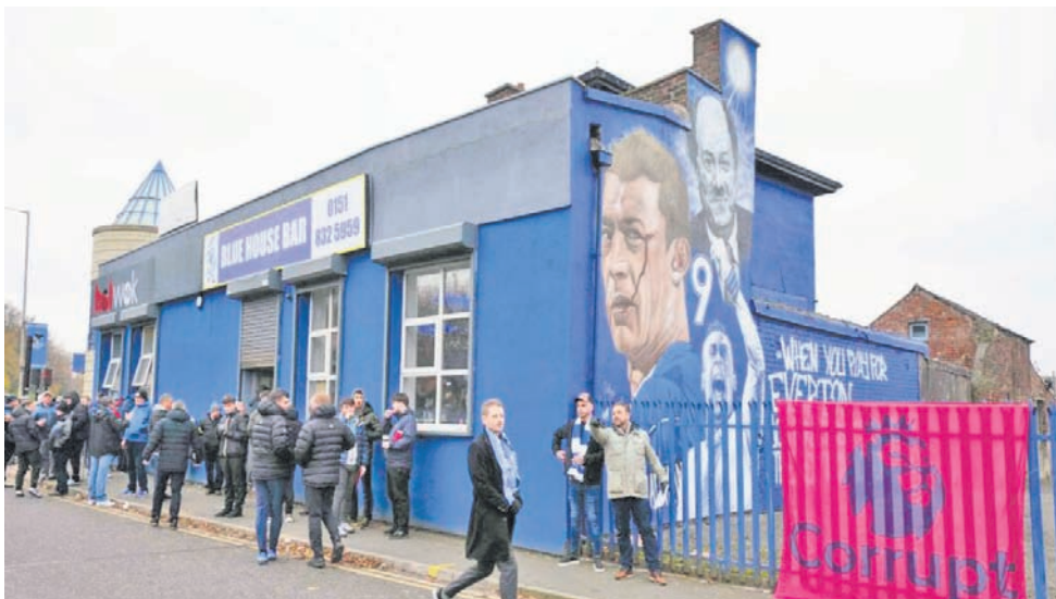
مشجعو إيفرتون الغاضبون يحتجون على خصم النقاط

ومع ذلك، يجب التأكيد هنا على أن الأندية نفسها هي التي صوتت لصالح تطبيق هذه القواعد. وخلال الصيف الماضي، وافقت الأندية على التعامل مع انتهاكات قواعد الريح والاستدامة