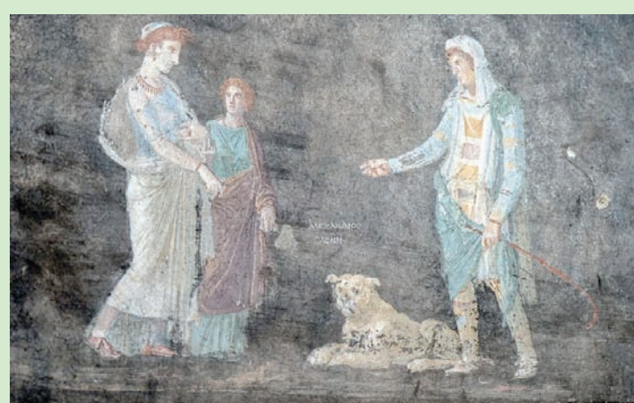
شخصيات إغريقية أسطورية منها «هيلاثة الطروادية» (مدينة بومبي الرومانية)

وقال: «في الضوء المتلألئ، تشعر كأن اللوحات قد عادت تنبض بالحياة». وتسيطر لوحات جداريتان على المشهد: الأولى تجسد الإله أبولو محاولاً إغواء الكاهنة كاساندرًا. لكن