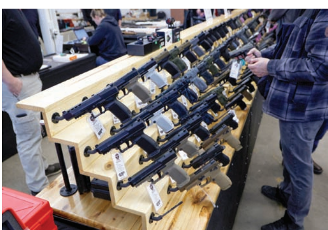
زبانن يشترون أسلحة نارية من معرض في دي موين بولاية أيوا

الإنترنت، أو في معرض للأسلحة أو في متجر فعلي. إذا كنت تبغ الأسلحة في الغالب لتحقيق الربح، فيجب أن تكون مرخصاً، ويجب عليك التصرف». وعد أن «هذه اللائحة هي خطوة تاريخية في معركة وزارة العدل ضد العنف المسلح. سيقلق الأرواح».