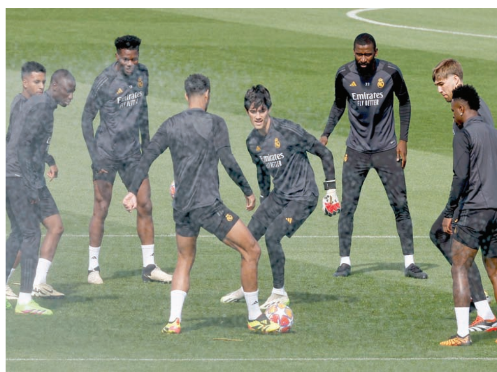
يسعى ريال مدريد لاستعادة الثقة قبل مواجهة الإياب أمام مانشستر سيتي في دوري الأبطال

ويتسلح الريال في هذه المباراة بسجل قوي، حيث لم يتلق الريال سوى خسارة واحدة فقط هذا الموسم، كما أن الفريق حقق 3 انتصارات و3 تعادلات في آخر 6 مواجهات بالدوري. ويأمل الإيطالي كارلو أنشيلوتي، المدير الفني للريال، أن يحقق فريقه الفوز بهذه المباراة من أجل مصلحة الجماهير بعد التعادل مع ضيفه مانشستر سيتي 3 - 3 في ذهاب دور الثمانية بطولية دوري أبطال أوروبا. ويرغب أنشيلوتي في تحقيق الفوز بهذه المباراة من أجل استعادة الثقة قبل مواجهة الإياب أمام مانشستر سيتي والتي سيسعى الريال للفوز بها بثنتي الطرق لمواصلة مشواره في البطولة الأوروبية. وسيدخل ريال مدريد المباراة