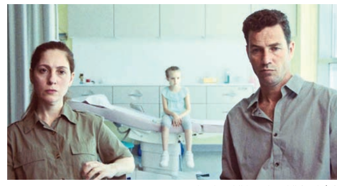
«المفتاح»، لركان مياسي (راكان مياسي)

● وداعاً طبريا ★★ إخراج: لينا سويلم تسجيلي فرنسا 2023