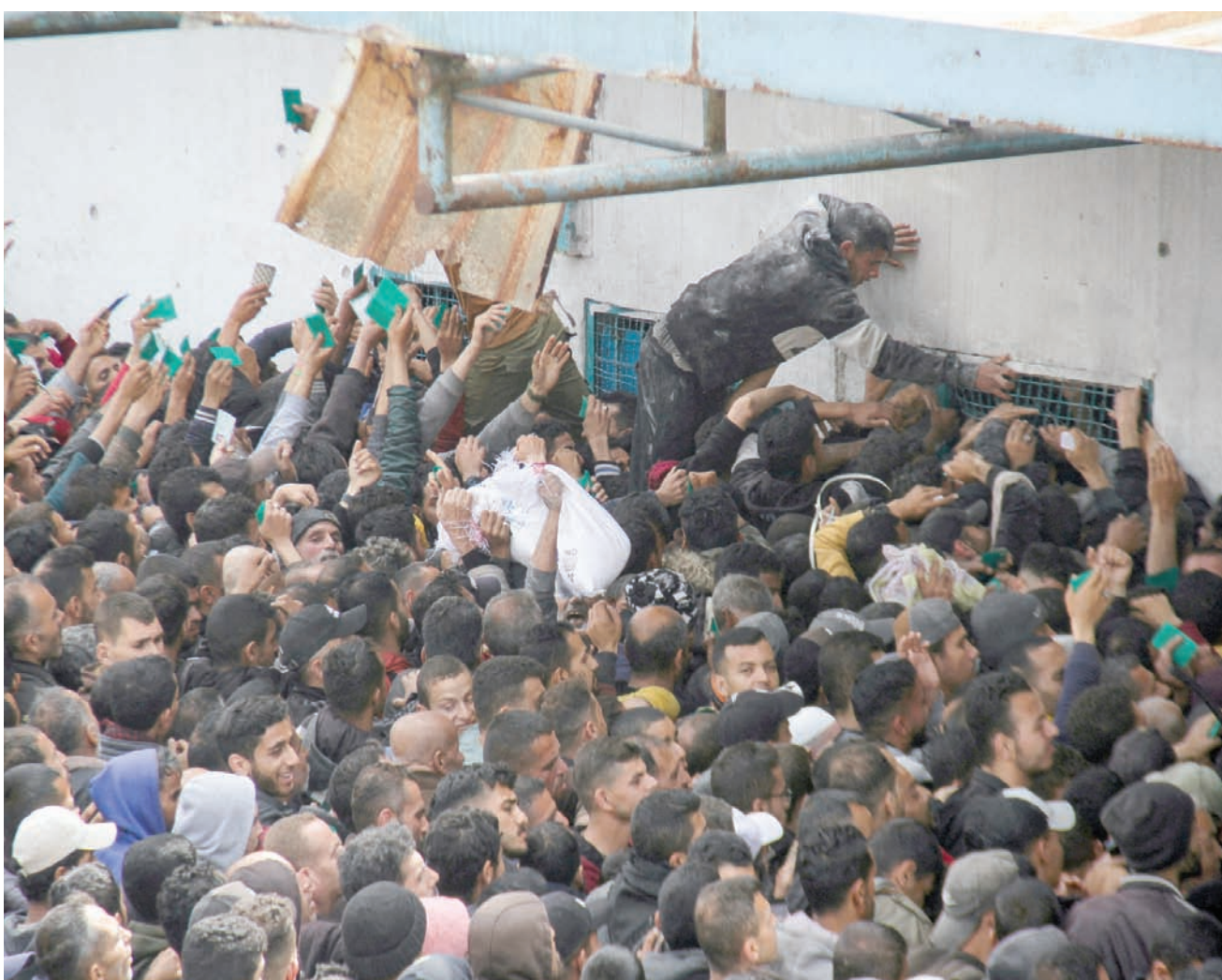
فلسطينيون يتجمعون لتلقي مساعدات من وكالة الأمم المتحدة لإغاثة وتشغيل اللاجئين الفلسطينيين (أونروا) في غزة مارس الماضي

وكانت باور تدلي بشهادة أمام لجنة المخصصات في مجلس النواب حول ميزانية وكالتها المقترحة لعام 2025، عندما سالها النائب الديمقراطي جواكين كاسترو عن تقارير إرسال موظفين لدى الوكالة الأميركية برفقة إلى مجلس الأمن القومي تفيد بأن المجاعة بدأت في أجزاء من غزة. وقال: «هل تعتقدون بأنه من المعقول، أو المحتمل، أن أجزاء من غزة، خصوصاً شمال غزة، تعاني المجاعة فعلاً؟» فردت باور بالإيجاب، مستشهداً بتقييم أجرته «المبادرة العالمية للتصنيف