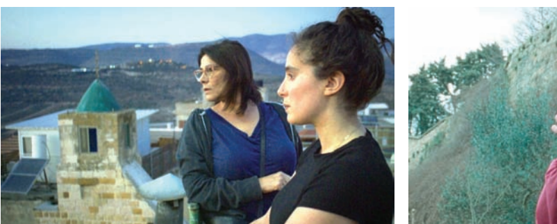
«وداعاً طبريا» (لايبتيكس)

● عروض: مهرجان برلين 2024. ضعيف ★ وسط ★★ جيد ★★★ جيد جداً ★★★★★ ممتاز ★★★★★