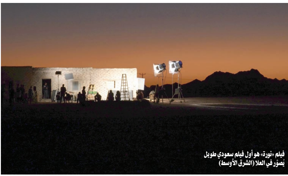
فيلم «نورة» هو أول فيلم سعودي طويل يُصوّر في الغلا

ومن الجدير بالذكر أن السعودية وفّرت مواقع تصوير مميزة لأفلام هوليوودية كبيرة، حيث استضافت الغلا فيلم الحركة والإثارة «قندهار» للمخرج ريك رومان وو، من بطولة جيرارد بترل، وفيلم الإثارة «ماتش ميك» من إنتاج «نتفليكس»، كما تُبرّز نجوم بصفتها أكبر منشأة حديثة في المنطقة، مُقدّمة الدعم لنحو 30 إنتاجاً، منها فيلم الملحمة التاريخي «محارب الصحراء» لروبيرت وايت، من بطولة أنتوني مكي، ومسلسل المغامرة الخيالية «رايز أوف ذا تيشيز»، أكبر مسلسل تلفزيوني أُنتج بالتعاون مع طاقم عمل سعودي، وفيلم الكوميديا «دونكي» من إخراج راجكومار هيراني وبطولة النجم العالمي الشهير شاروخان. وتستضيف السعودية مهرجانيين سينمائيين سنوياً، إن من المنتظر أن ينطلق «مهرجان أفلام السعودية» بدورته العاشرة في 2 مايو المقبل، لمدة 8 أيام، وذلك في مركز الملك عبد العزيز الثقافي العالمي «إثراء» في الظهران، وفي نهاية العام ينتظر صنّاع الأفلام «مهرجان البحر الأحمر السينمائي الدولي» الذي يقام في جدة، ويحظى باهتمام دولي كبير.