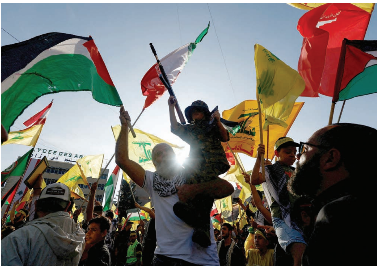
مناصرون لـ«حزب الله» بالضاحية الجنوبية يشاركون في حفل تكريم عناصر قتلوا بمواجهات مع إسرائيل

ويؤكد درباس لـ«الشرق الأوسط» أنه «عندما يتفكك المنزل وتزيد تشققاته، لا يمكن أن نستغرب كيف تعصف به الريح». ويقول: «لا يمكن لأي حزب أو كيان أو ميليشيات أن تحل مكان الدولة مهما قويت شوكتها»، معاً أن «تفكك الدولة سببه ازدياد السلطة وسيطرة (حزب الله) عليها»، مضيفاً: «عندما حكم الفلسطينيون لبنان، تفككت الدولة وانهارت، واليوم