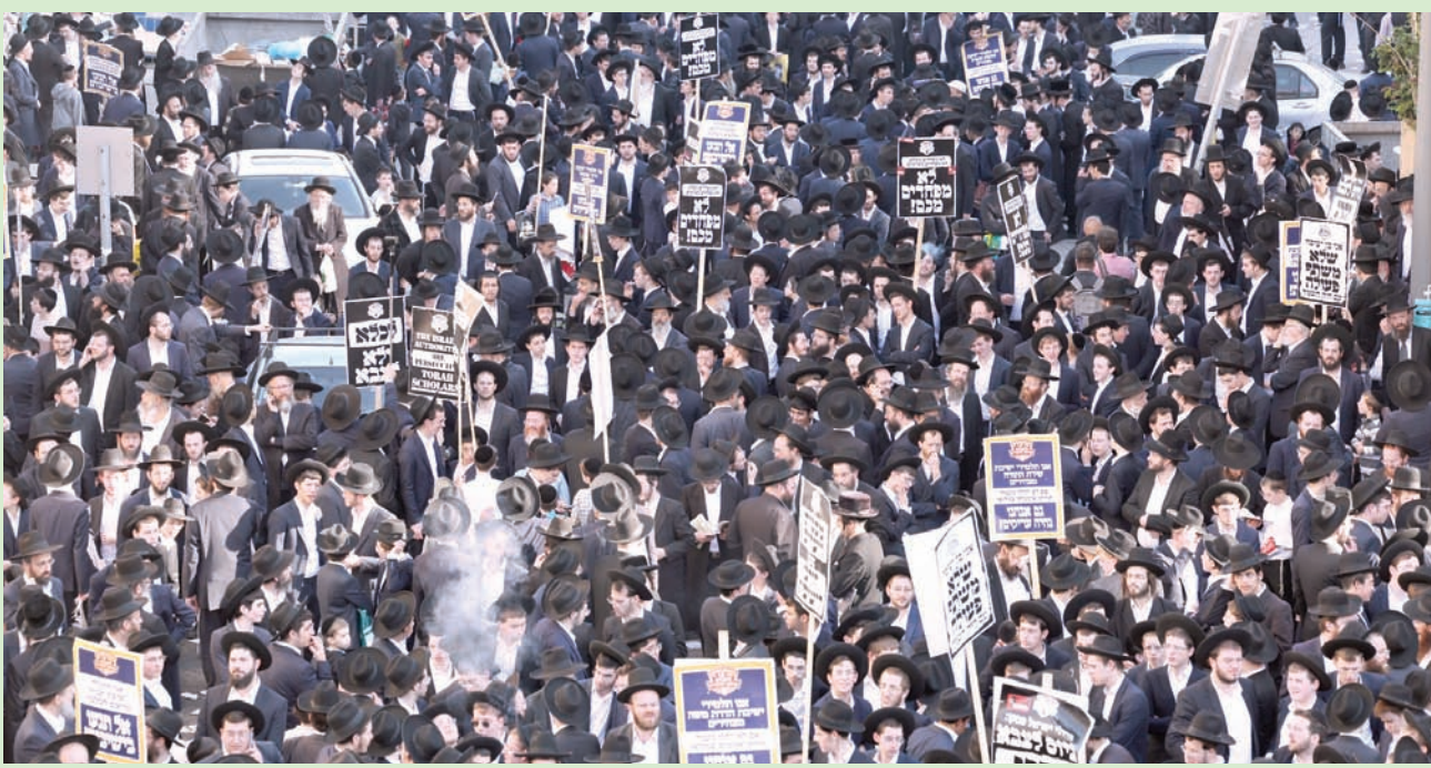
يهود متدينون خلال احتجاج في القدس أمس ضد قانون الخدمة العسكرية

في مناطق بعيدة عن الحرب في غزة. ودعا كل من ألمانيا وروسيا إلى خفض التوتر الإقليمي. وأفادت «رويترز» بأن المبعوث الأميركي للشرق الأوسط، بيرت ماكغورك، اتصل بوزراء خارجية عرب، طالباً منهم التواصل مع نظيرهم الإيراني، لحضه على التهدئة. وقالت بعثة إيران لدى «الأمم المتحدة» إن «ضرورة رد إيران» على الهجوم على قنصليتها في دمشق كان من الممكن التغاضي عنها، لو ندد مجلس الأمن الدولي بالهجوم وحاسب المسؤولين عنه. (تفاصيل ص3)