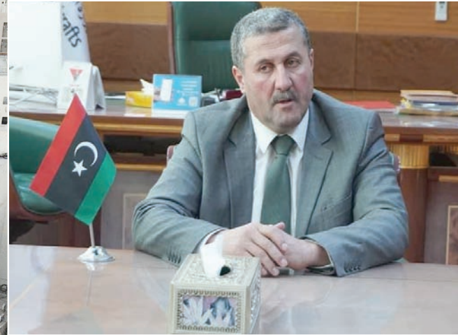
وزير السياحة في حكومة «الوحدة» الليبية ناصر الدين الفرزاني (حكومة الوحدة)

قال وزير السياحة بحكومة «الوحدة الوطنية» المؤقتة، ناصر الدين الفرزاني، إن ليبيا باتجاهها للتعافي بعد وسمها بأنها «بلد صراعات سياسية وفوضى أمنية»، وذلك من خلال إخراجها من «قائمة السفر الحمراء» لبعض الدول.