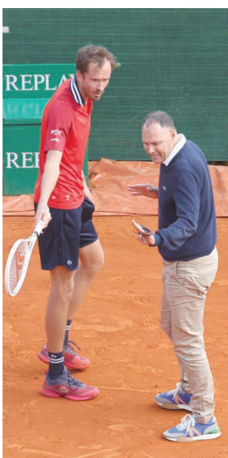
الروسي دانييل مدفيدف يواصل اعتراضه على القرارات التحكيمية

وفي المجموعة الثانية، اشتدت المنافسة وصولاً إلى 5 - 5 قبل أن يخسر الروسي إرساله وأعصابه. وقال خاتشانوف: «اعتقد أن نتائجي تتحسن شيئاً فشيئاً في الأوتة الأخيرة... أنا سعيد للفوز عليه للمرة الأولى منذ 2018». وأضاف حامل فضية أولمبياد طوكيو: «الفوز على اللاعبين الأعلى تصنيفاً من الأمور التي يجب أن نفيقها في ذهننا ونعمل عليها. الفوز اليوم يضع ثقة إضافية في جيبتي للاستمرار في هذه الدورة والتقدم في التصنيف». وسيلعب خاتشانوف، المصنّف 17، في ربع النهائي مع اليوناني ستيفانوس تسيتسيباس بطل «مونتني كارلو» مرتين (2021 و 2022) والفائز على الألماني الكسندر زفيريف المصنّف خامساً 7 - 5 و 6 - 3 (7 - 3). وقال ستيتسيباس (25 عاماً)، الذي احتاج إلى ساعتين و6