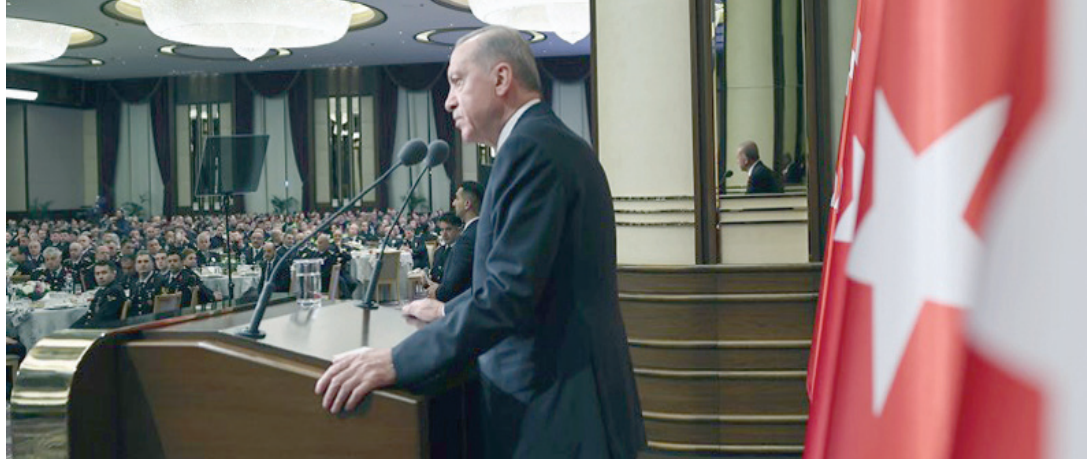
إردوغان أكد أنه لا مكان للتنظيمات الإرهابية في مستقبل بلاده والمنطقة

وتعرضت تركيا لعقوبات أميركية بسبب شراء المنظومة الروسية، منها منعها من اقتناء مقاتلات «إف 35»، ولم تتمكن حتى الآن من استخدامها. وذكرت الصحيفة أن فصائل المعارضة المسلحة السورية الموالية لأنقرة أكدت أنها