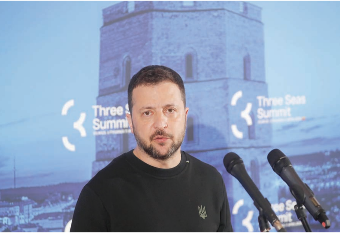
الرئيس الأوكراني فولوديمير زيلينسكي