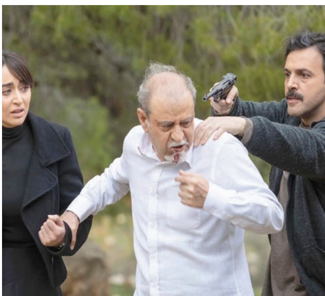
استلهمت الكثير من نجمي العمل بسام كوسا وتيم حسن (إنستغرام)