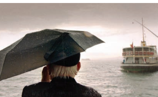
«فارق» (مهرجان برلين)

وحيداً، فعمته البيت مقصودة لتشي بعتمة البيئة نفسها. «ترانزيت» لباقر الربيعي من العراق يأخذنا إلى موضوع آخر.