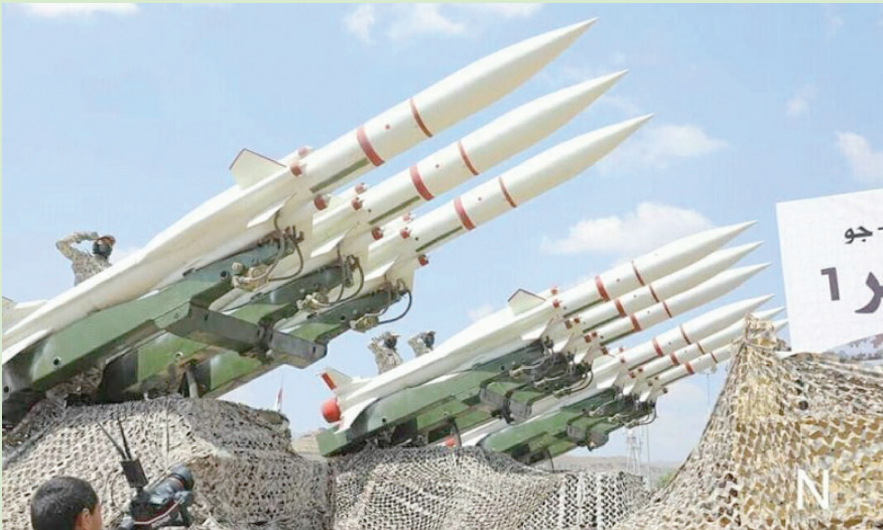
صواريخ حوثية تقول الحكومة اليمنية إن إيران تقوم بتزويدها إلى الجماعة في اليمن

ومع تجمد مساعي السلام التي تقودها الأمم المتحدة في اليمن، بسبب الهجمات الحوثية والضربات الغربية، يخشى المبعوث هانس غرونولدبرغ من عودة القتال بين القوات الحكومية والجماعة المدعومة من إيران، بعد عامين من التهدة الميدانية.