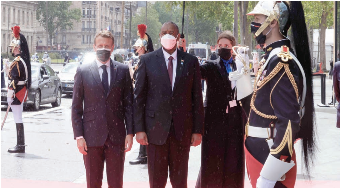
صورة أرشيفية للرئيس ماكرون مرحباً برئيس مجلس السيادة السوداني عبد الفتاح البرهان خلال مؤتمر باريس 17 مايو 2021

تضع باريس اللمسات الأخيرة على حدث مزدوج تستضيفه الإثنين المقبل، 15 أبريل (نيسان)، يتناول الوضع السوداني في جانبه السياسي والإنساني، وهي منظمة بالتعاون مع ألمانيا والاتحاد الأوروبي، في غياب التمثيل الرسمي السوداني.