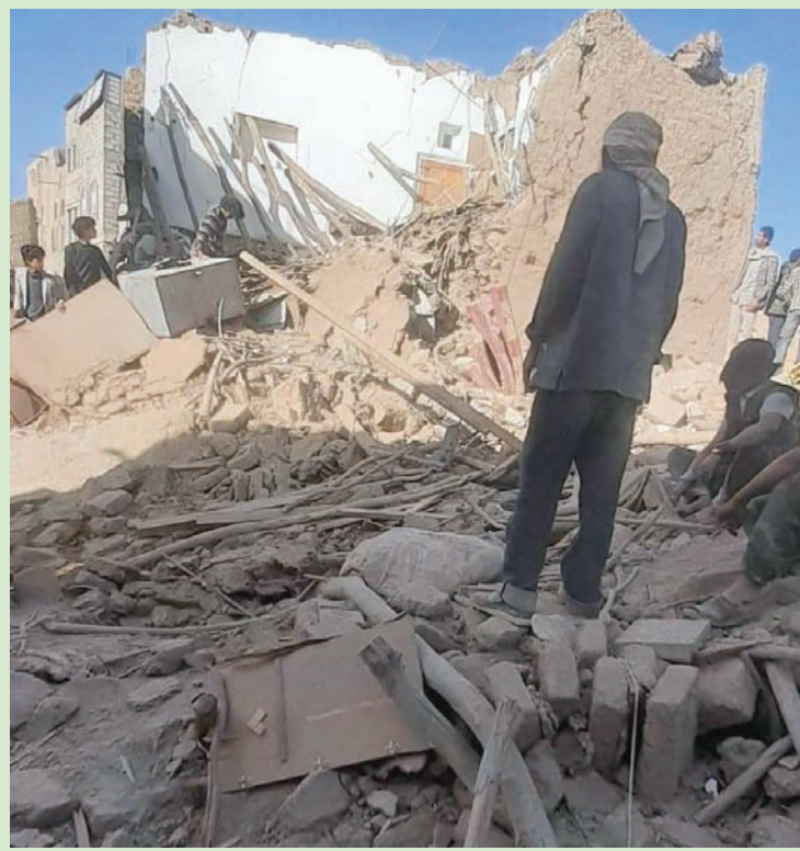
جانب من الدمار جراء تفجير الجماعة الحوثية لحي سكني في ردا (إكس)

وكان وزير الإعلام اليمني معمر الإرياني وصف هذا التصرف بـ«النفسي القسري» لرفات الضحايا بهدف التستر على تورط قيادات الجماعة بالجريمة. ويتهم أهالي وأقارب الضحايا الجماعة الحوثية بالتحايل على مطالب الإنصاف والقبض ببدن ضحايا التفجير من إحدى العائلات في مدينة يريم باعتبار أن أصولها تعود إلى هذه المدينة، إلى جانب التعهد ببناء منزل لها في هذه المدينة، وهو ما يعدونه محاولة لطمس الجريمة، وإجبارهم على سنيانها.