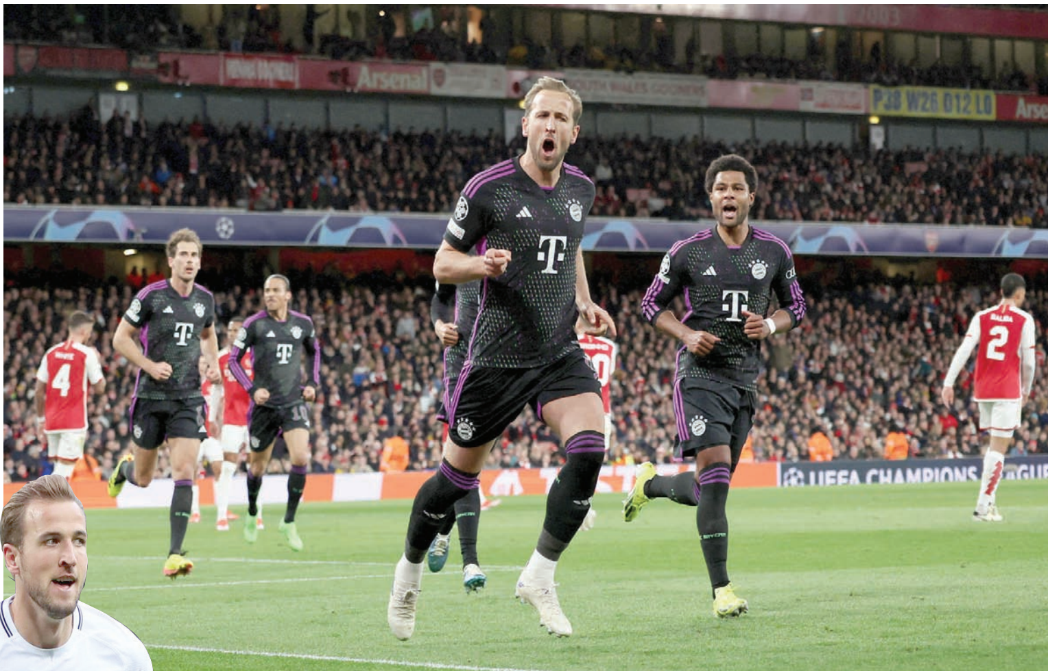
كين وفرحة هز شبك أرسنال في ذهاب دوري أبطال أوروبا الثلاثاء (رويترز)

في الواقع، لا يزال بايرن ميونخ يمتلك ما يمكن وصفه بـ«جينات البط». وكان كين حريصاً على الاستفادة من درس تاريخي مختلف تعلمه خلال الفترة التي قضاها مع توتنهايم. لقد أشار كين إلى موسم 2018-2019 عندما تراجع توتنهايم إلى المركز الرابع بعد سبع هزائم في آخر 12 مباراة في الدوري الإنجليزي الممتاز، لكن ذلك لم يؤثر عليه في مشواره في دوري أبطال أوروبا، ووصل إلى المباراة النهائية للمرة الأولى في تاريخه بعدما قدم مستويات رائعة، وخاصة في مباراة الدور نصف النهائي أمام أياكس. لم يشترك كين أمام النادي الهولندي، وكذلك في مباراة الإياب للدور ربع النهائي ضد مانشستر سيتي، بسبب الإصابة، لكن