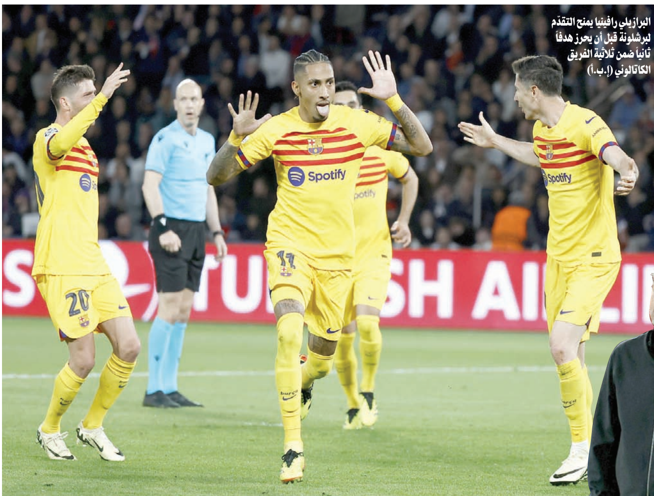
البرازيلي رافينيا يمنح التقدم لبرشلونة قبل أن يحرز هدفاً ثانياً ضمن ثلاثة الفريق الكاتالوني

وأضاف: «لكننا سوف نتحسن، سنفكر بشكل إيجابي فيما يتعين علينا القيام به في برشلونة، وهو ببساطة التعامل مع المباراة كما لو كانت مباراة نهائية، من أجل تحقيق الفوز». وأوضح المدرب السابق