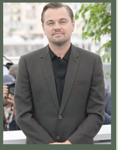
الممثل الأميركي ليوناردو دي كابريو