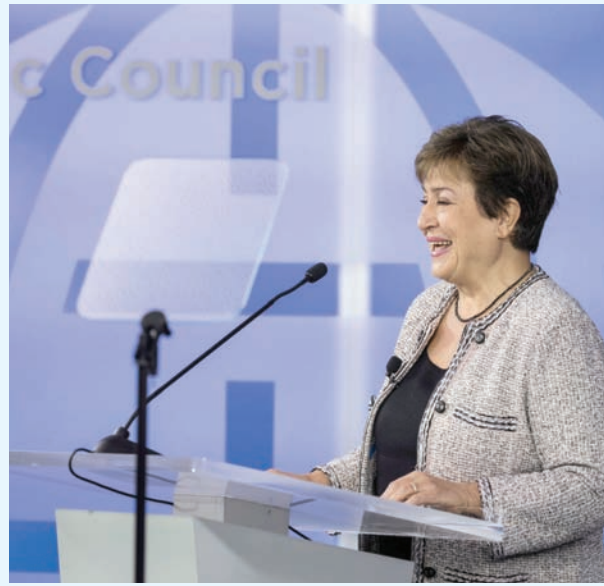
غورغييفا في خطابها أمام المجلس الأطلسي (منصة «إكس»)