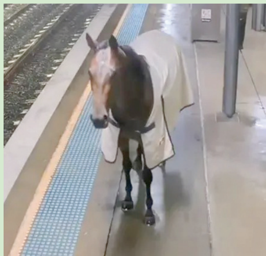
الحصان داخل محطة القطار