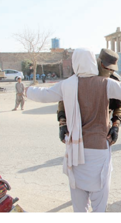
«طالبان» الأفغانية تفحص الأشخاص والعربات قبل عيد الفطر في قندهار (أ.ب.أ)

شهد العامان الماضيان ظهور جماعات إرهابية أصغر وأقل شهرة في المناطق الحدودية الباكستانية - الأفغانية، وهي التي تعلن مسؤوليتها عن الهجمات المتكررة على قوات الأمن الباكستانية. ويعتقد بعض الخبراء أن هذه الجماعات الأصغر والأقل شهرة ليس لها وجود مستقل، وإنما مجرد فروع لحركة «طالبان الباكستانية» وجماعات مسلحة أخرى أقدم يبدو أنها تغير استراتيجيتها تحت ضغط من «طالبان الأفغانية» لعدم مهاجمة الجيش الباكستاني والمصالح الصينية في المنطقة. وفي مقدمة هذه الجماعات الأصغر والأقل شهرة تنظيم «حركة الجهاد» الباكستاني. ولا أحد يعرف شيئاً عن هذا التنظيم سوى أنه أعلن مسؤوليته عن عدة هجمات على قوات الأمن الباكستانية. وأرسل هذا التنظيم رسائل إلى وسائل الإعلام والصحافيين يعلن فيها مسؤوليته عن عدة هجمات في الشمال الغربي مؤخراً. ومع ذلك، عندما سأل الصحافيون الباكستانيون ومسؤولي الأمن الباكستانيين عن حقيقة التنظيم، بدا كلاهما متردداً في تأكيد وجوده.