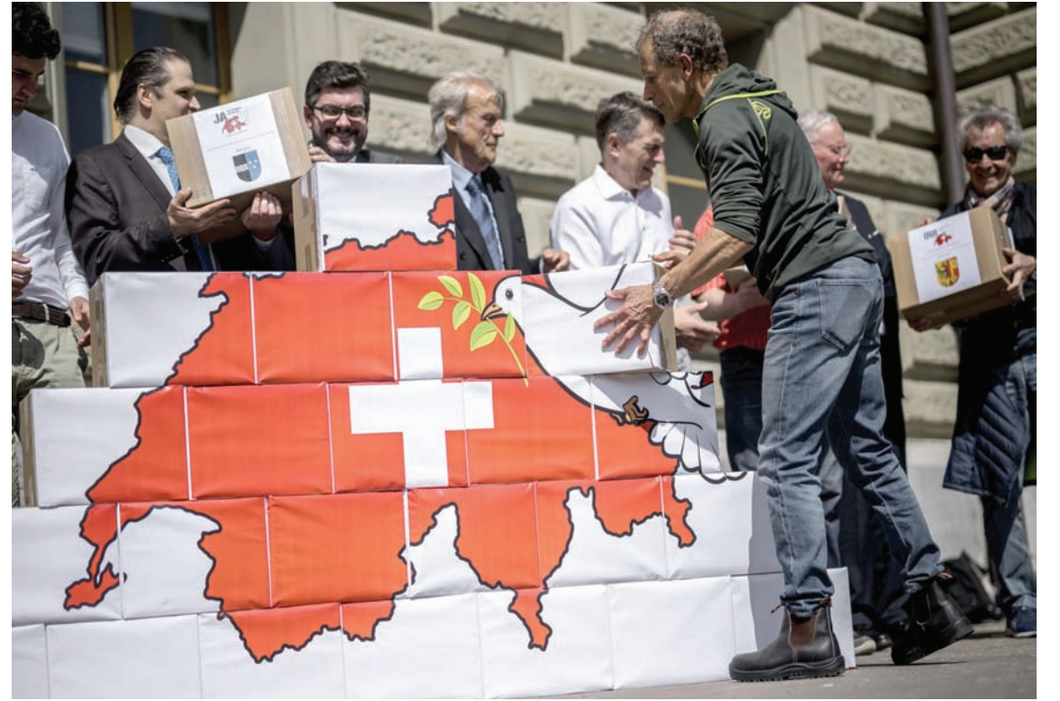
أصحاب «مبادرة الحياض السويسري» يعرضون توقيع 140 ألف شخص يطالبون بعدم تبني العقوبات الأوروبية ضد روسيا

وزير الخارجية الأميركي أنتوني بلينكن خلال الاحتفال بالذكرى الـ75 لتأسيس التكتل العسكري الغربي قبل أيام. وهددت موسكو أوكرانيا بالاجتياح قبل الحرب عندما بدأ الحديث عن تمدد الحلف شرقاً. وأصبحت عضوية كيف في الحلف من القضايا التي تخيرها موسكو بالنسبة لأي خطة سلام مستقبلية. ونقلت وكالة أنباء «بي إيه ميديا» البريطانية الخميس، عن رئيس الوزراء الأسبق تحذيره أيضاً من استرضاء الرئيس الروسي فلاديمير بوتين، خلال حديثه في فعالية بكندا. وقال جونسون خلال الاسترالي السابق توني أبتون، إن «حل هذه المشكلة هو الأمن والاستقرار اللذان باتياناً مع اليقين بشأن مكانة أوكرانيا وما هي أضرارها». وأضاف: «لقد اختارت أوكرانيا أن تكون دولة أوروبية حرة ومستقلة متوجهة نحو الغرب، ونحو الاتحاد الأوروبي، ونحو حلف شمال الأطلسي»، مؤكداً: «يجب أن تخضع أوكرانيا إلى حلف شمال الأطلسي، هذه هي الطريقة المنطقية الوحيدة لذلك». وقال رئيس الوزراء الأسبق إن المخاوف من أن تتغير مثل هذه الخطوة غضب بوتين، لا يمكن أن تحول دون اتخاذ أي إجراء.