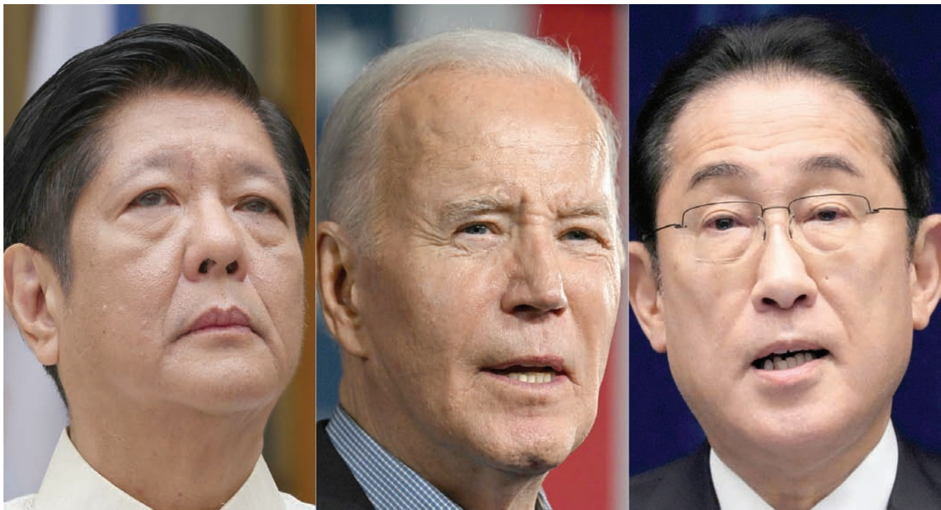
صورة مركبة لرؤساء اليابان وأميركا والفلبين