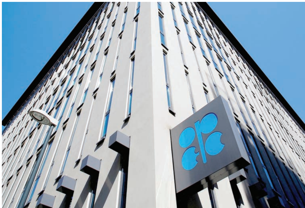
من المقرر أن تعقد «أوبك بلس» اجتماعاً في يونيو لاتخاذ قرار بشأن الإنتاج

العراق وكازاخستان بتحقيق التوافق الكامل مع أهداف الإنتاج والتعويض عن فائض الإنتاج، فضلاً عن إعلان روسيا أن تخفيضاتها في الربع الثاني ستعتمد على الإنتاج بدلاً من الصادرات. وقالت «أوبك» إن الأعضاء الذين أفاضوا في العروض خلال الربع الأول سيدعمون خطط التعويض بحلول نهاية الشهر. ومن المقرر أن يعقد «أوبك بلس» اجتماعاً في يونيو لاتخاذ قرار بشأن احتمالات تدفع بنمو الاقتصاد العالمي في 2024». وحافظت على توقعات النمو الاقتصادي العالمي عند 2,8 في المائة للعام الحالي، و2,9 في المائة لعام 2025. ورفعت تقديراتها للنمو الاقتصادي الأمريكي إلى 2,1 في المائة لعام 2024 من 1,9 في المائة سابقاً، وأبقتها عند 1,7 في المائة لعام 2025، ولم تتغير توقعات النمو في منطقة اليورو عند 0,5 في المائة هذا العام و1,2 في المائة في العام المقبل.