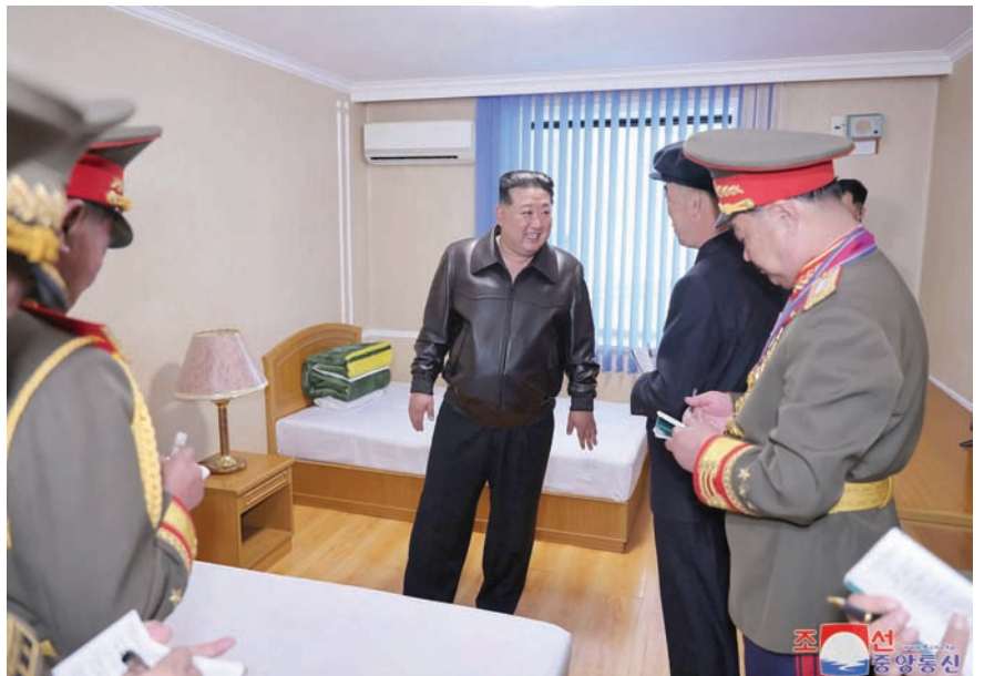
الرئيس الكوري الشمالي كيم جونغ أون لدى زيارته جامعة كيم جونغ إيل في بيونغ يانغ الأربعاء

وفي ذلك اللقاء وافقت الفلبين على منح الولايات المتحدة حق الوصول إلى أربع قواعد في الجزر التابعة لها.