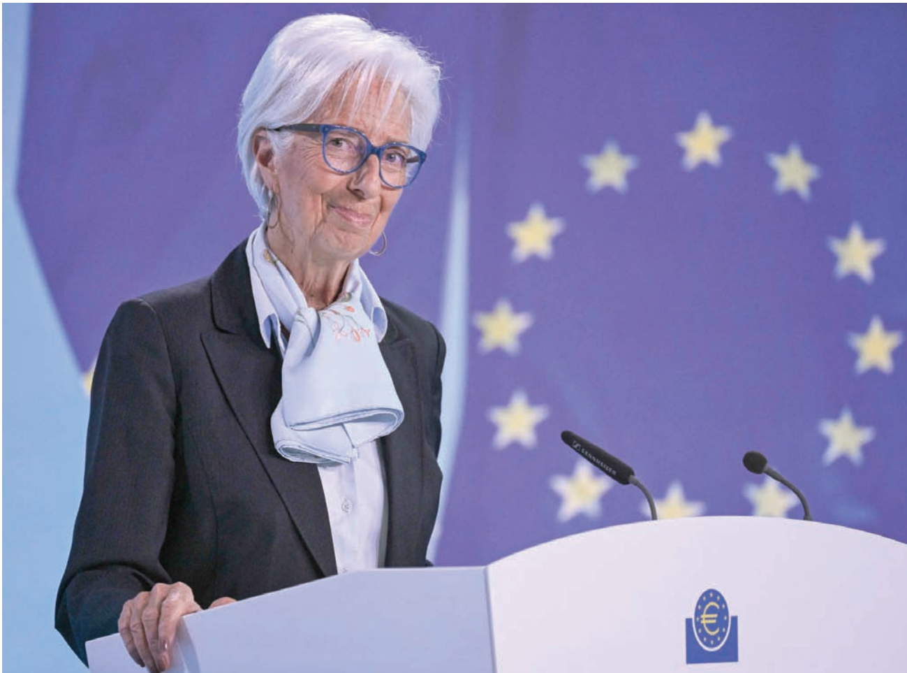
رئيسة المصرف المركزي الأوروبي كريستين لاغارد في مؤتمرها الصحفي

تأتي تعليقات غورغييفا فيما تستعد للترشح بمحافظي البنك المركزي ووزراء المالية في واشنطن الأسبوع المقبل لحضور اجتماعات الربيع لصندوق النقد والبنك الدوليين. وسينشر الصندوق مجموعة