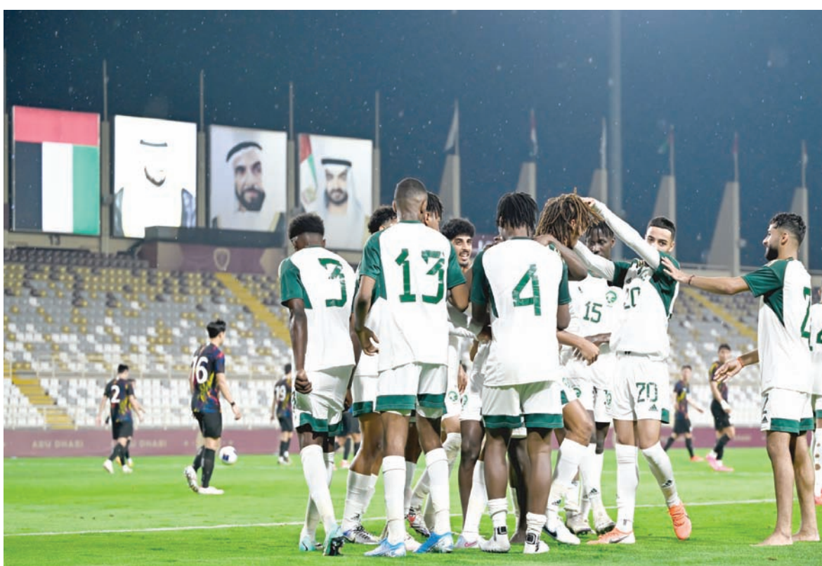
الأخضر الأولمبي كسب وديته الأخيرة أمام المنتخب الكوري الجنوبي

لتايلاند في النهائيات. ووصل المنتخب القادم من جنوب شرقي آسيا إلى الدور ربع النهائي عندما استضاف البطولة في عام 2020، قبل أن يخسر 0 - 1 أمام السعودية. وتتطلع طاجيكستان إلى التأهل إلى الأدوار الإقصائية للمرة الأولى بعد أن احتلت المركز الأخير في مجموعتها في أول مشاركة لها في البطولة قبل عامين.