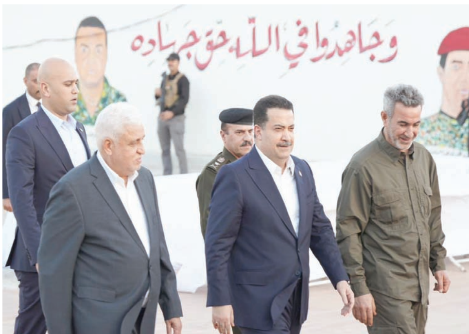
السوداني يتوسط رئيس «الحشد الشعبي» فالح الفياض ورئيس أركانه أبو فهدك

ومع حسم هذه الملفات سيسهل طريق السوداني إلى البيت الأبيض، على حد وصف قيادي في «الإطار التنسيقي»، لكنه أشار في حديث مع «الشرق الأوسط»، إلى أن «عدم تحقيق المكاسب من واشنطن كما يريدها قادة أحزاب شيعية قد يعني عودة التوتر مجدداً».