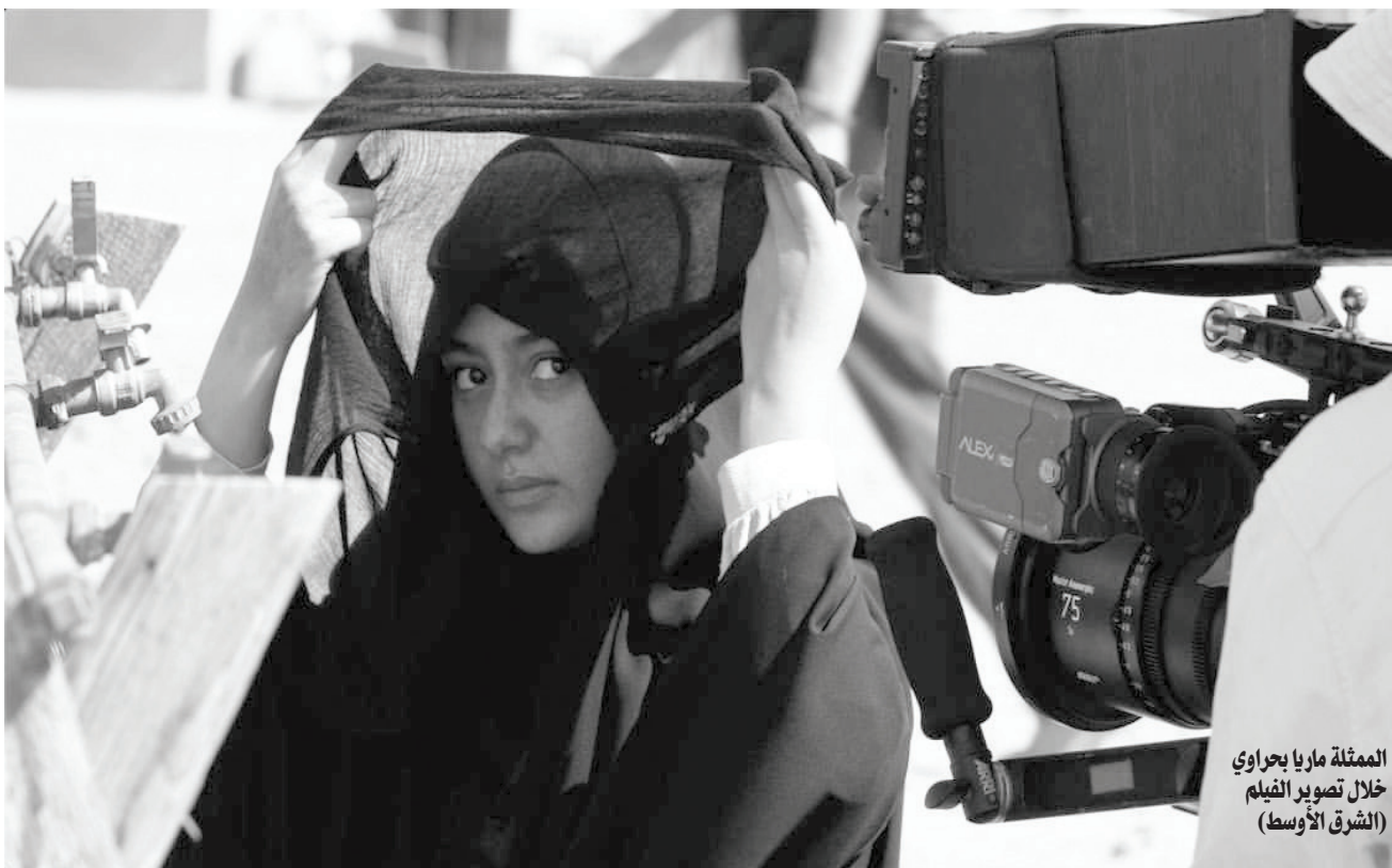
الممثلة ماريا بحراوي خلال تصوير الفيلم

واستطرد في شرح فكرته: «عند سماع الموسيقى أو تأمل لوحة، فإننا نتوحد مع هذا العمل؛ وهي حالة لا تحدث مع أي عامل آخر. وحده الفن يخاطب الفرد بشكل انفرادي، خصوصاً في زمن التسعينات حين كان وسيلة الاتصال والتعبير»، مستشهداً بوفرة عدد الشعراء والفنانين في تلك الحقبة