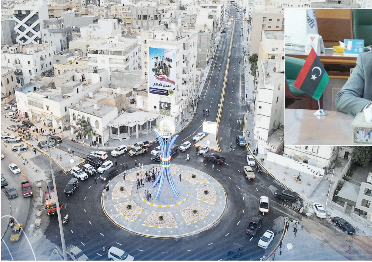
شارع النصر وجزيرة بومشاشة وسط العاصمة طرابلس (حكومة الوحدة)