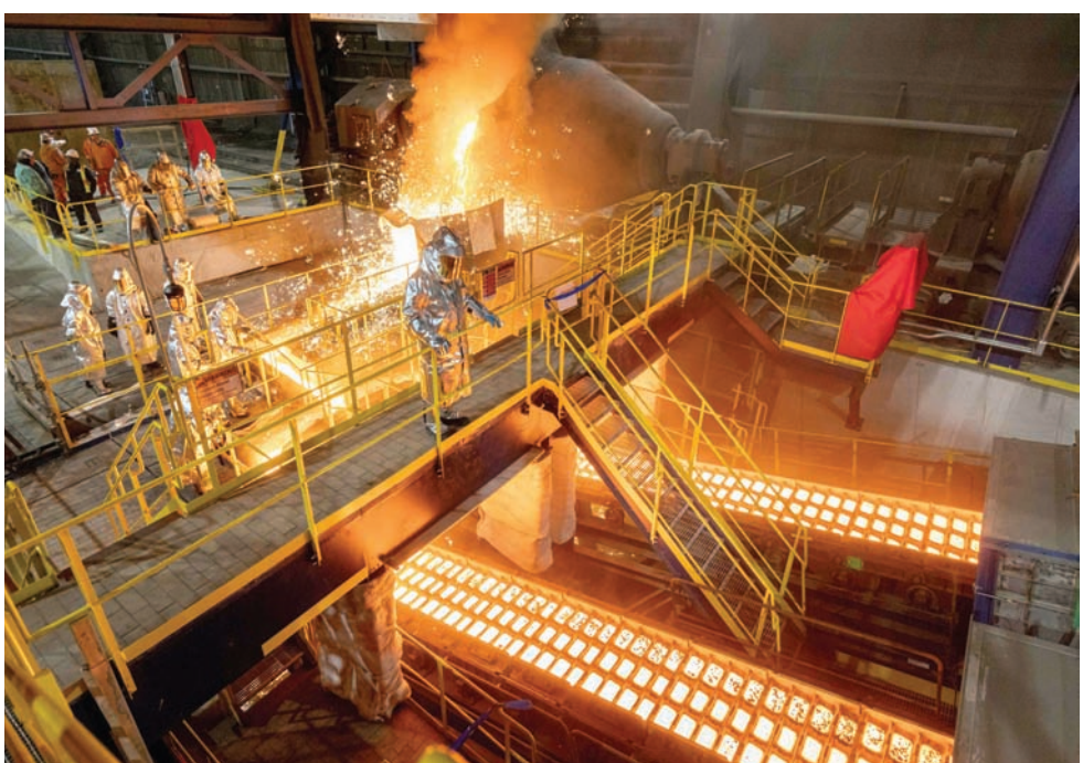
نقابة عمال الصلب الأمريكية تعارض بشدة صفقة استحواذ «نيبون ستيل» على «يو إس ستيل»

وقالت «نيبون ستيل» إنها ستشتري شركة «يو إس ستيل» بسعر 55 دولاراً للسهم الواحد، وإن سعر الشراء يمثل علاوة بنسبة 40 في المائة على سعر إغلاق سهم الشركة الأمريكية في 15 ديسمبر 2023.