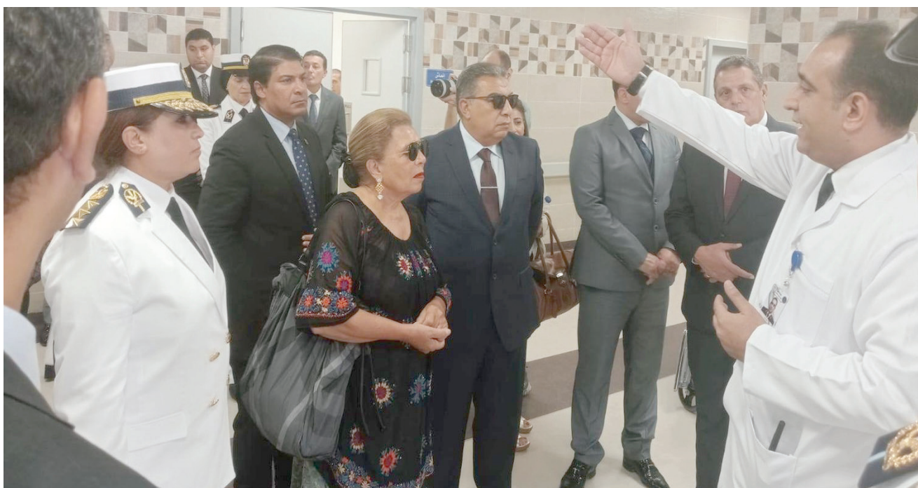
السفيرة مشيرة خطاب رئيسة «المجلس القومي لحقوق الإنسان» في زيارة سابقة لمركز الإصلاح والتأهيل التابع لوزارة الداخلية المصرية

وأكد مسؤول بوزارة الدفاع التركية، الشهر الماضي، التوصل إلى اتفاق بشأن التعاون مع المسؤولين العراقيين حول إنشاء منطقة أمنية بعمق 40 كيلومتراً في شمال العراق بحلول الصيف، كما أعلن