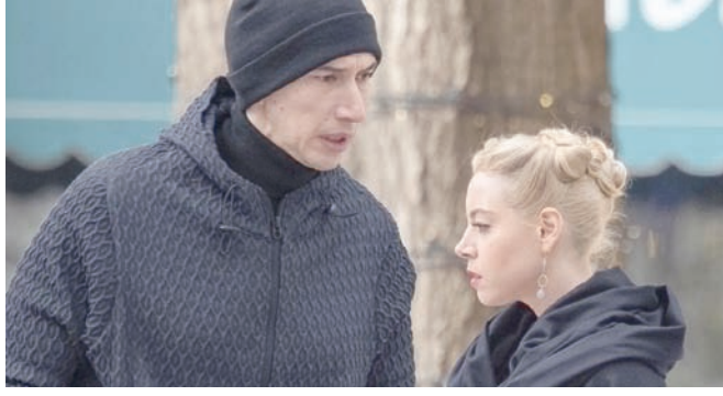
لقطة من فيلم «ميغالوبوليس»