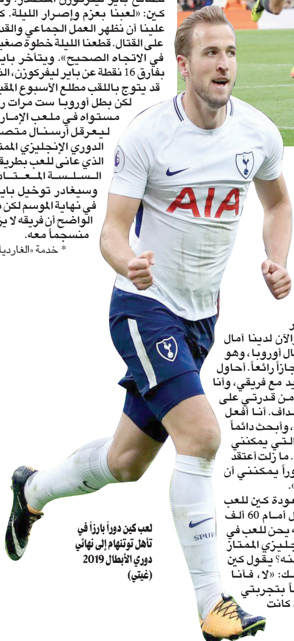
لعب كين دوراً بارزاً في تأهل توتنهايم إلى نهائي دوري الأبطال 2019

بسبب الطريقة التي انتهى بها الأمر في الدوري الألماني، كان علينا أن نظهر العمل الجماعي والقدرة على القتال. قطعنا الليلة خطوة صغيرة في الاتجاه الصحيح». ويتأخر بايرن بفارق 16 نقطة عن باير ليفركوزن، الذي قد يتوج باللقب مطلع الأسبوع المقبل، لكن بطل أوروبا ست مرات رفع مستواه في ملعب الإمارات ليحرق أرسنال متصدراً الدوري الإنجليزي الممتاز الذي عانى للعب بطريقته السلسلة المعتادة.