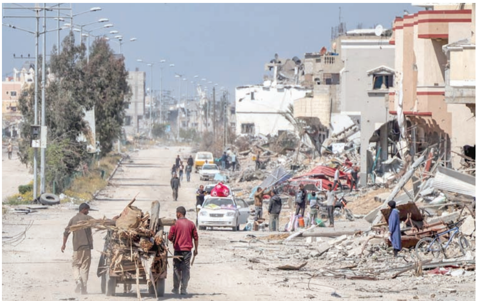
أكثر من مليون من سكان غزة فروا من الشمال خلال الأشهر الأولى من القتال

واستضافت القاهرة، الأحد الماضي، جولة جديدة من المفاوضات غير المباشرة بين حركة «حماس» وإسرائيل، بحضور ممثلين من قطر والولايات المتحدة