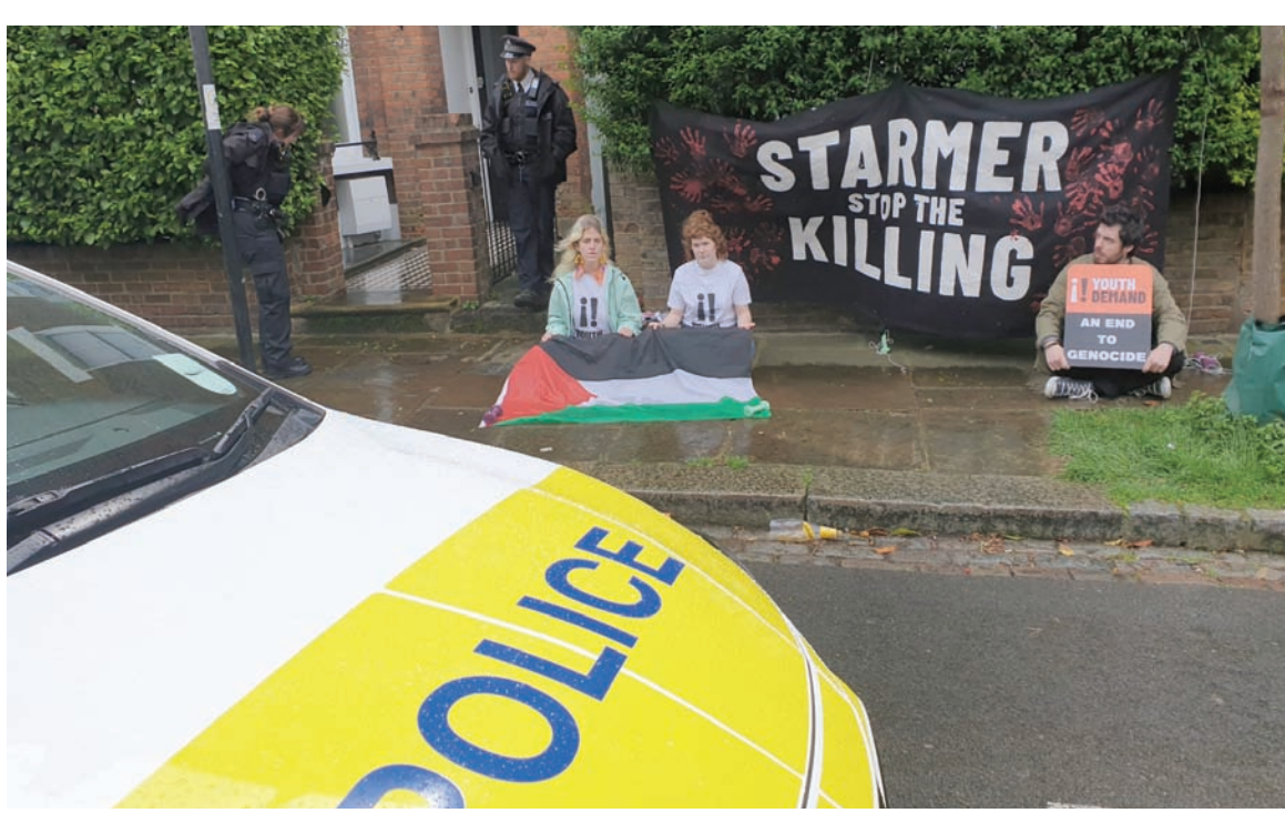
نشطاء أمام منزل زعيم حزب «العمال» مطالبين بالتوقف عن بيع الأسلحة إلى إسرائيل