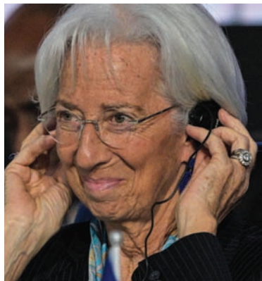
كريستين لاغارد

مع انخفاض التضخم بشكل أكبر، واستمرار ضعف اقتصاد منطقة اليورو، فإن النقاش حول خفض أسعار الفائدة سيكون أكثر سخونة من أي وقت مضى في اجتماع المصرف المركزي الأوروبي في فرانكفورت في السابع من مارس (آذار). ومع ذلك، فإن التضخم الأساسي العنيد، خصوصاً تضخم الخدمات، وعدم اليقين بشأن تطورات الأجور، والثقة التي لا تنتهي في الانتعاش الاقتصادي في منطقة اليورو، سوف ينعكس في خفض أسعار المصرف المركزي الأوروبي من خفض أسعار الفائدة - على الأقل في اجتماع الأسبوع المقبل. وما دام أن المصرف المركزي الأوروبي ليس على استعداد لقبول عودة التضخم تقريباً إلى الهدف، ولكنه بدلاً من ذلك يدفع نحو نقطة هبوط محددة تبلغ 2 في المائة، فإن خفض أسعار الفائدة يجب أن يكون على جدول أعمال اجتماع يونيو (حزيران) فقط. وهذا هو الوقت الذي ستوفر فيه نقاط بيانات كافية، إما لتأكيد أنه تم بالفعل ترويض وحش التضخم، أو للإشارة إلى تجدد الضغوط الصاعدة على الأسعار. وكان نائب رئيس المصرف المركزي الأوروبي لويس دي غويندوس، قال يوم الأربعاء، إن المصرف المركزي الأوروبي يحتاج إلى مزيد من البيانات قبل البدء في خفض أسعار الفائدة. وكان التضخم في منطقة اليورو واصل اتجاهه الهبوطي في فبراير (شباط)، حيث