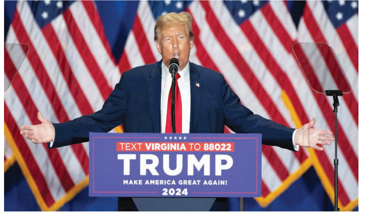
الرئيس الأميركي السابق دونالد ترمب يتحدث خلال تجمع انتخابي في ريشموند بولاية فرجينيا السبت (أ.ف.ب.)

المقبل، فيسحلم بايدن رقمه القياسي بوصفه أكبر رئيس أميركي سناً في منصبه، وسيكون عمر بايدن 86 عاماً بنهاية ولايته الثانية.