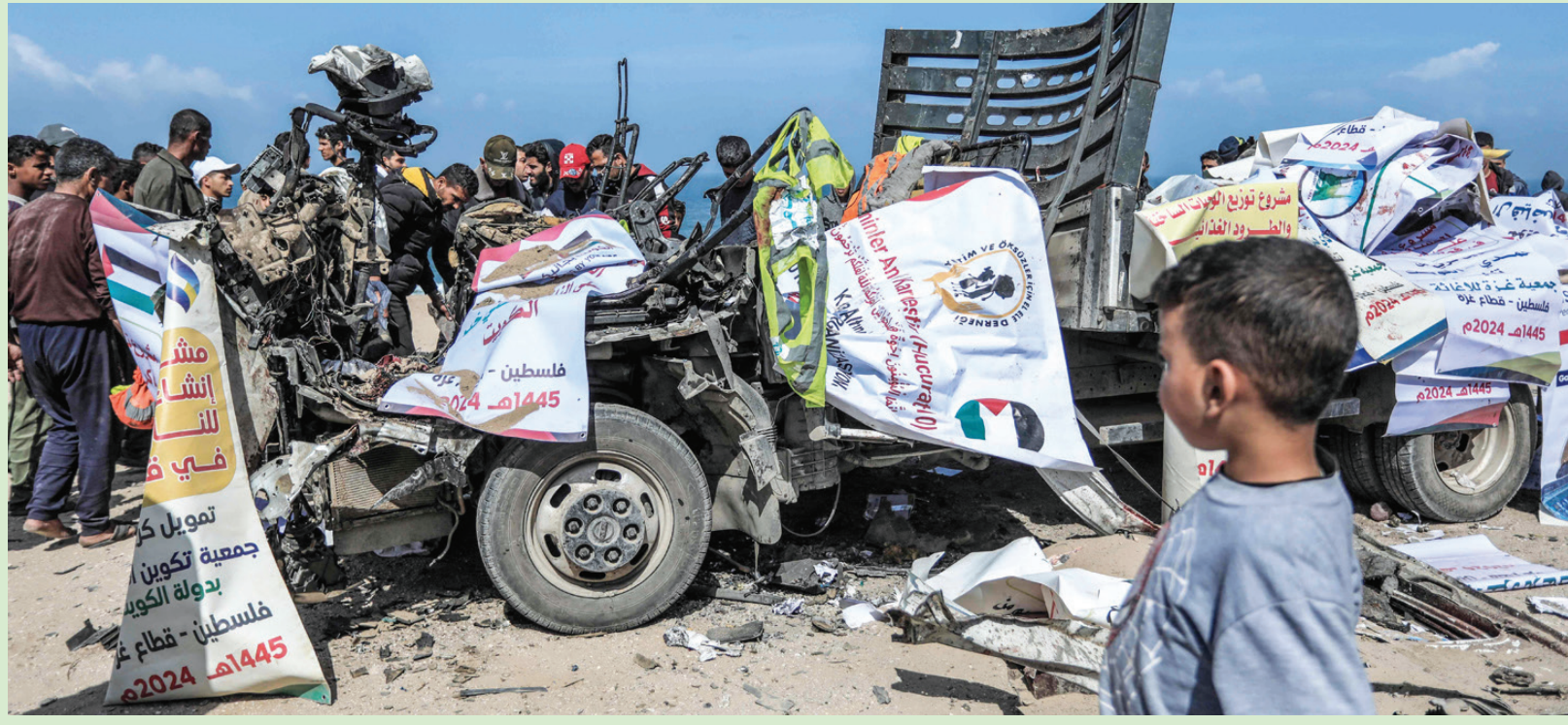
قتل وأصيب عدد من الفلسطينيين في غارة جوية إسرائيلية استهدفت شاحنة مساعدات إنسانية على الطريق الساحلي الرئيسي في دير البلح وسط قطاع غزة أمس (أ.ف.ب)

في دورته الـ159 بمقر الأمانة العامة لمجلس التعاون في الرياض، أمس، المجتمع الدولي، باتخاذ موقف جاد وحازم لوقف إطلاق النار ونوفير الحماية للمدنيين، واتخاذ الإجراءات اللازمة، ضمن القانون الدولي، للرد على ممارسات الحكومة الإسرائيلية وسياسة العقاب الجماعي التي تنتهجها ضد سكان غزة، مشيداً في الوقت ذاته بالجهود التي يبذلها عدد من الدول والمنظمات لوقف العدوان الإسرائيلي على القطاع. (تفاصيل ص 2 و 4 و 5)