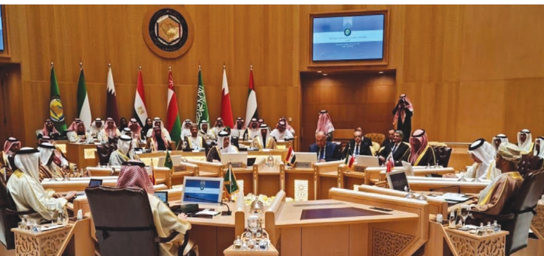
اجتماع مشترك لوزراء خارجية دول مجلس التعاون الخليجي ومصر في الرياض