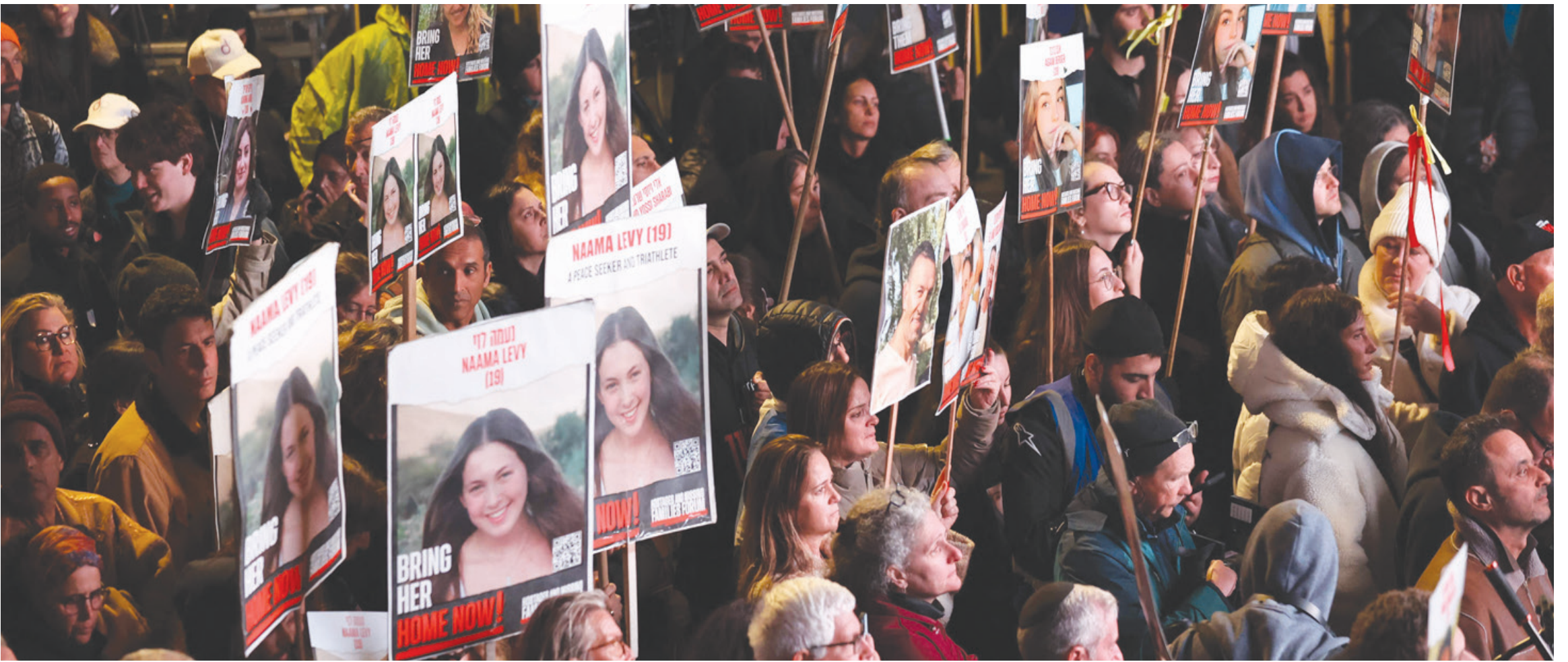
صور للرهائن الإسرائيليين ترفعها عائلاتهم أمام مقر إقامة رئيس الوزراء الإسرائيلي في القدس يوم السبت لتأمين إطلاق سراح الرهائن الذين تحتجزهم «حماس»