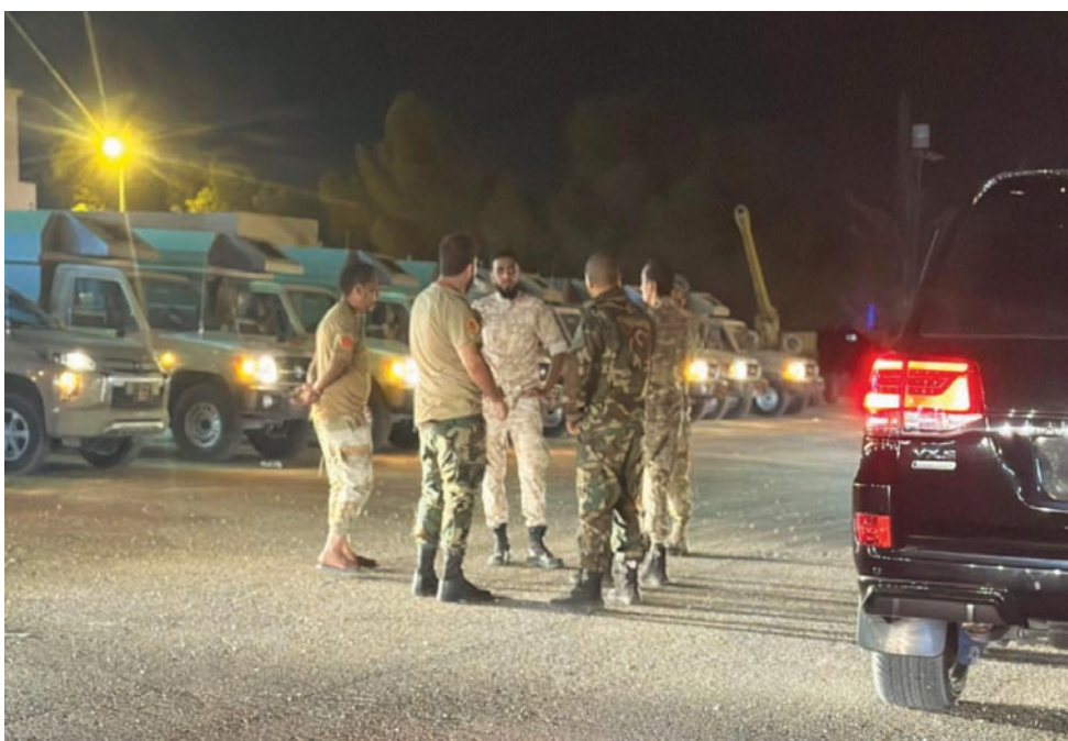
انتشار عناصر أمنية ليبية للفصل بين ميليشيات الزاوية (الكتيبة 103 مشاة)

وكان الجهاز قد أعلن إغلاق ضاحية بمنطقة الزاوية الغربية، حفاظاً على أرواح المواطنين، لافتاً إلى توجيه العائدين إلى مدينة طرابلس من طريق فرعية، كما