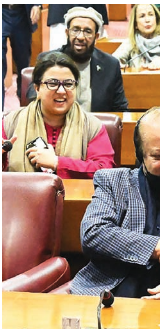
نواز شريف يصافح شقيقه شهباز شريف بعد انتخابه داخل البرلمان الباكستاني رئيساً للوزراء أمس

كان من المتوقع أن يتولى أخوه نواز شريف السلطة بعد عودته في أكتوبر (تشرين الأول) من منفاه الذي دام 4 سنوات في لندن، وينبغي الآن على شهباز شريف، المعروف بحسب التسوية، والذي يُعتقد أحياناً بسبب تردده، المحافظة على تماسك حكومته والتعامل مع الجيش الذي يهيمن بشدة