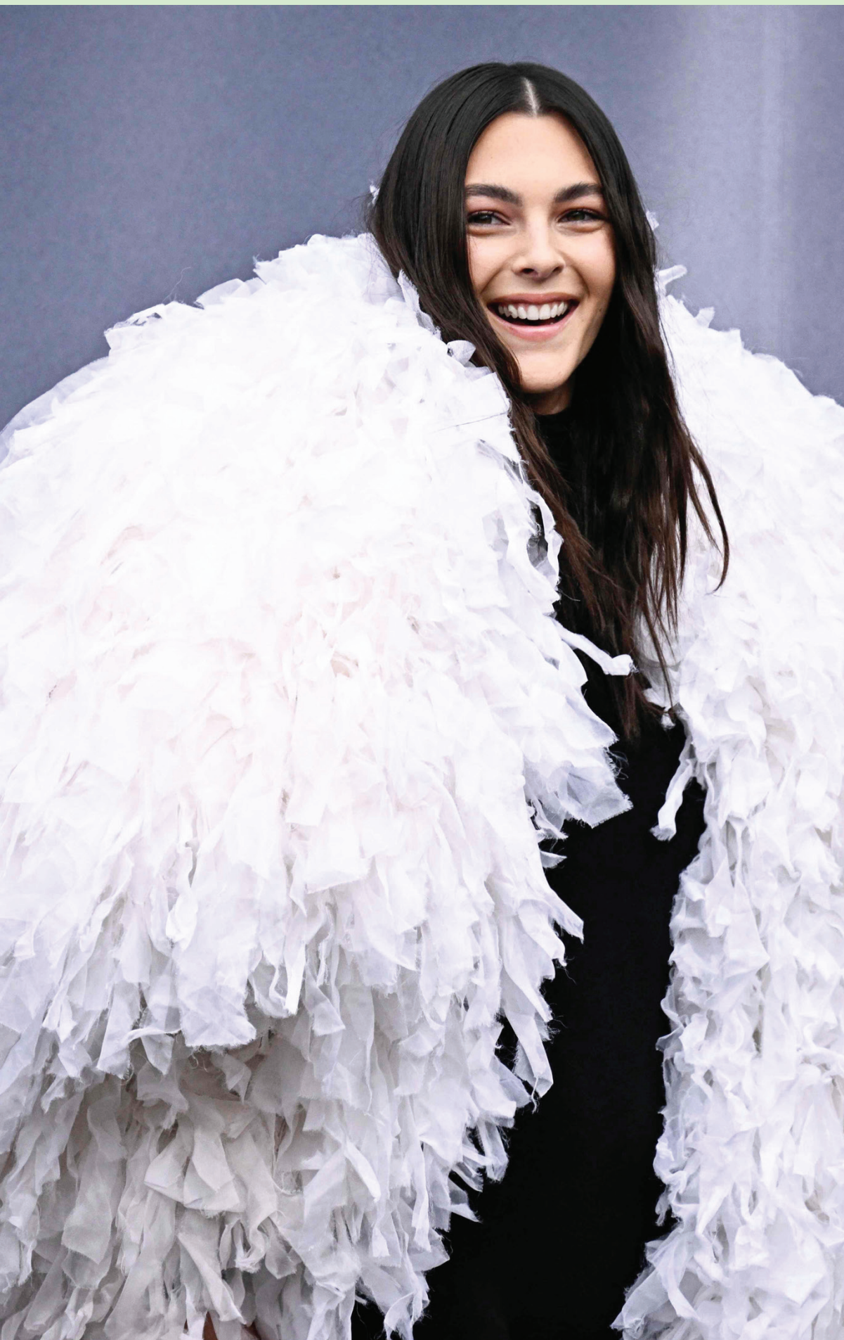
عارضة الأزياء الإيطالية فينيتورا سيريتي لدى وصولها إلى «أسبوع الموضة» في باريس أمس

الكويت دولة مهمة ومجتمعها حيوي، خاصة في السياسة، لكن ثمة هواجس تتعلق باستراتيجيات المستقبل في عالم شرق أوسطي لا يرحم.