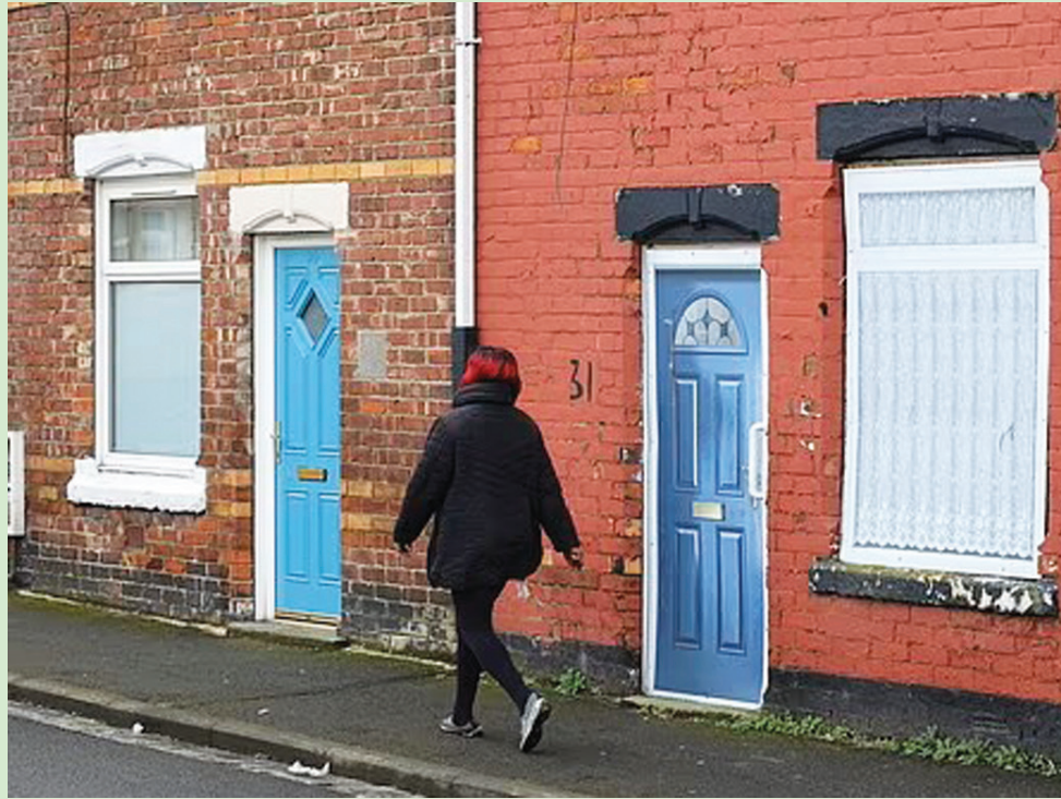
المجلس يغطي المنازل الفارغة بأبواب ونوافذ بلاستيكية (نورث نيوز)

الأمامية، بينما حمل منزل آخر ملحوظة من المجلس المحلي معلقة على الباب الأمامي تحذر من غزو القوارض.