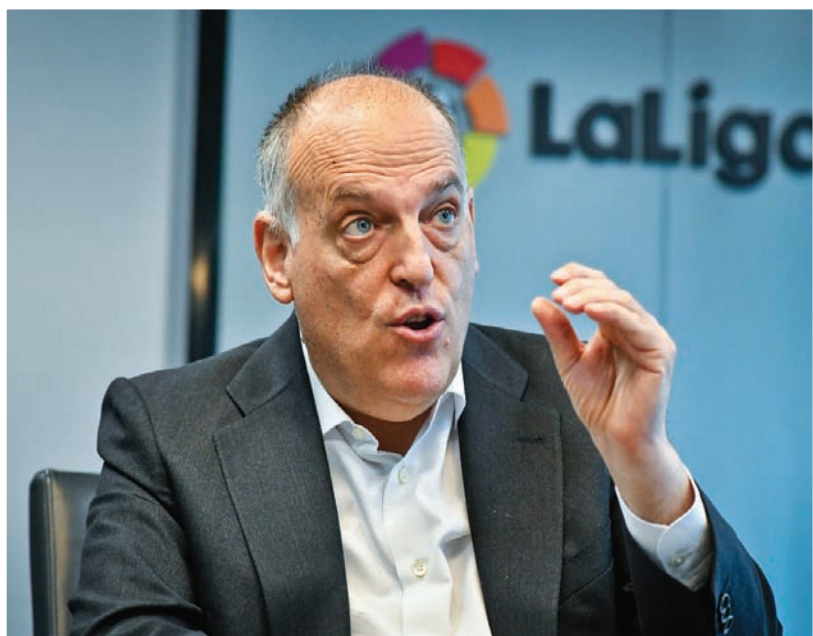
خافيير تيباس رئيس رابطة الدوري الإسباني لكرة القدم (الشرق الأوسط)

- نحن الآن في هذه الفترة نعمل لتجديد كيف سيسير الدوري الإسباني في المواسم المقبلة المقبلة في هذه المنطقة، جميع الخيارات متاحة. من الممكن الاستمرار في «بي إن سبورت» ومن الممكن أن يكون هناك ناقل إقليمي آخر، وهناك خيارات ناقلين محليين في