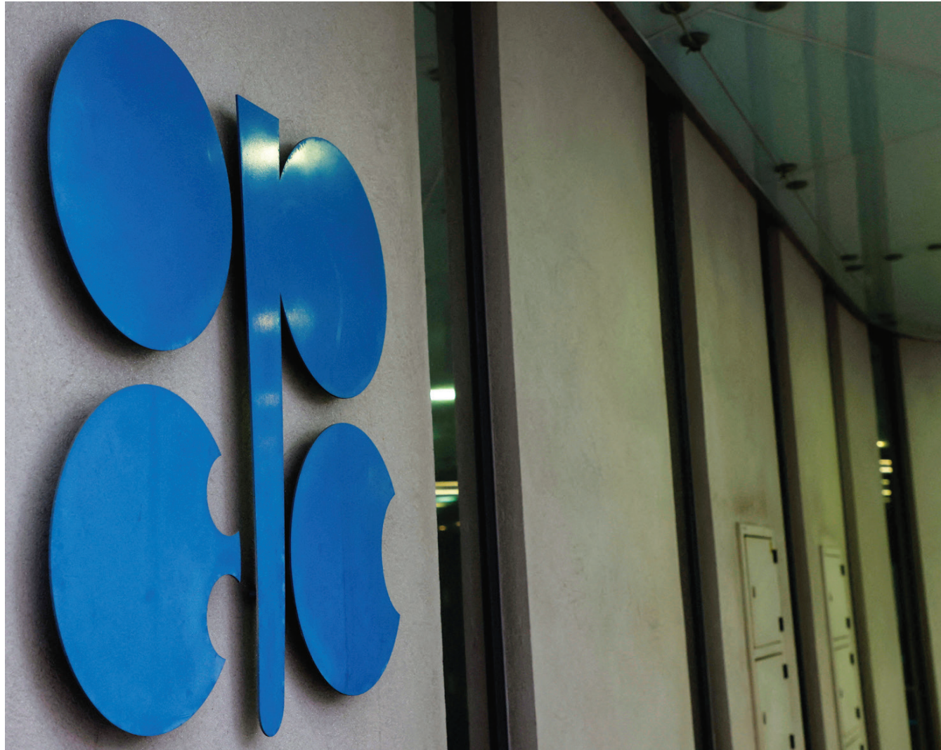
عواصم: «الشرق الأوسط»

وأخيراً يبدو أن «أبل» وجدت بالفعل ضالتها في الذكاء الاصطناعي، حيث يمكنها أن تحوّل إنفاقها الضخم على هذه المشاريع التي تعد مدخلات لجميع الصناعات في العالم، وامتلاكها للملاءة المالية يمكنها من الحصول على الموهب اللازم للمخوق في هذا المجال، لا سيما أنها شركة لها من الرصانة والحصانة في وادي السيليكون ما يجعلها قبلة للموهب. وهي بهذا تتوجه تبقياً في منطقة تملك فيها التفوق أو على الأقل ما يمكنها من التفوق، على عكس ما كانت الحال في صناعة السيارات الكهربائية.