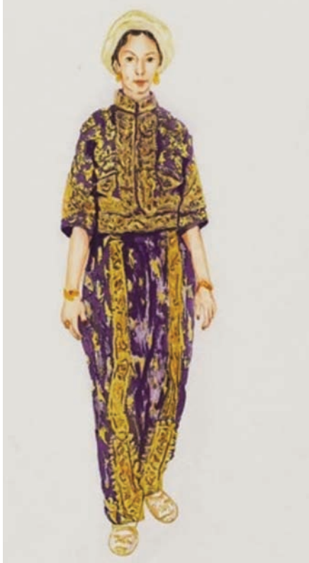
من مجموعة «تراثنا» المعرضة حالياً في بينالي الدرعية

السنين. وفي أواخر عام 1947 انتقلت مع أهلها إلى القاهرة، لتعود مجدداً إلى جدة عام 1963، وتجد العديد من التغيرات؛ إذ بدأ أهل المدينة بالزوح إلى المنازل المسوّحة وترك عاداتهم المتوارثة، إلى جانب استبدال بازياهم المميزة ما يساير الموضة الحديثة. ولم يكن في يدها إلا استرجاع الماضي بريشتها، فبدأت بجدية تامة لإعادة تكوين المدينة بأبنيتها وسكانها،