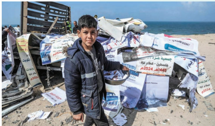
طفلة فلسطينية أمام شاحنة مساعدات إنسانية استهدفتها غارة إسرائيلية في دير البلح أمس

من جانبه، قال الجيش الإسرائيلي، أمس (الأحد)، إنه شن 50 هجمة في 6 دقائق على خان يونس جنوب قطاع غزة. في واحدة من أعنف الهجمات التي تتعرض لها المدينة. وأوضح الجيش في بيان نقلته وكالة أنباء العالم العربي، أن الهجمات شاركت فيها الطائرات المقاتلة بمساعدة قوات المدفعية، يوم السبت. وأضاف البيان أن من بين الأهداف التي تمت مهاجمتها بنى تحتية تحت الأرض، ومباني عسكرية، ومواقع لإطلاق النار، ونقاط تجمع مسلحين. وأوضح الجيش الإسرائيلي أن