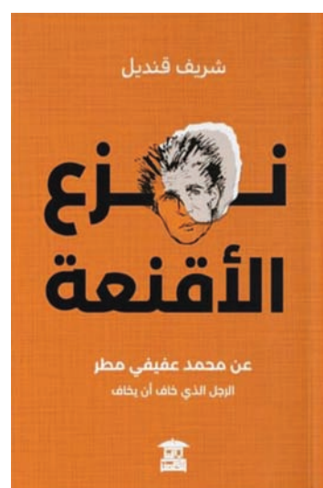
شريف قنديل عن محمد عفيفي مطر الذي عرف كذا أن يظف

بينما يتسم الإيقاع لغويًا وموسيقياً بنفس لمحمي تتواشج فيه كل هذه العناصر في تشكيل اللحن الشعري وتنميطه درامياً ليكتسب معنى السيمفونية الشعرية. ويضيف القصاص أن مطر أحياناً يفكك هذه الكتلة إلى مجموعة من العناصر البنائية المنفردة، ليصبح لكل عنصر إيقاعه المفرد الخاص، لكنها تنفرد وتجتمع بقوة هذه الحكمة وصلابة الأرض وامتدادها الروحي في شرايين الزمان والمكان، ومن ثم في شرايين الشعر والقصيدة والحياة، هنا يتحقق ما يمكن تسميته «جدل الكتلة والمفرد»؛ وهو جدل يتجمع بصيرورة شعرية خاصة تتلبور لسفياً من خلال متواليه الصعود والهبوط من السفح إلى القمة.