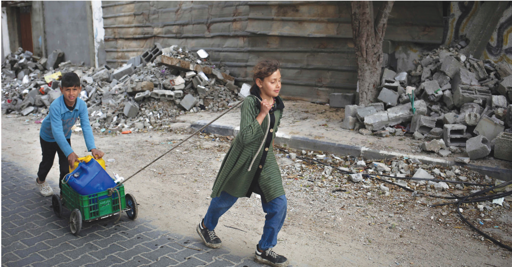
طفلة فلسطينية تبتلع حاويات مياه جنوب غزة

إلى «هدنة» لمدة 6 أسابيع، يتخللها تبادل للمحتجزين من الجانبين، ستعد أول «هدنة طويلة» منذ بدء الحرب في السابع من أكتوبر (تشرين الأول) الماضي، التي لم تتوقف سوى لأسبوع في شهر نوفمبر (تشرين الثاني) في إطار اتفاق «هدنة» عقد وقتها بوساطة مصرية-قطرية.