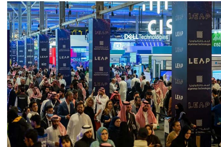
جانب من معرض «ليب» في نسخته الماضية

جودة الحياة وتعزيز التنافسية. اتفاقيات استراتيجية وسيضمن المعرض استعراض الجهات الحكومية، والشركات الوطنية لمنتجاتها وخدماتها الرقمية المعتمدة على نماذج مبتكرة باستخدام التقنيات الناشئة، إضافة إلى توقيع اتفاقيات استراتيجية وإطلاق خدمات جديدة، وإقامة جلسات