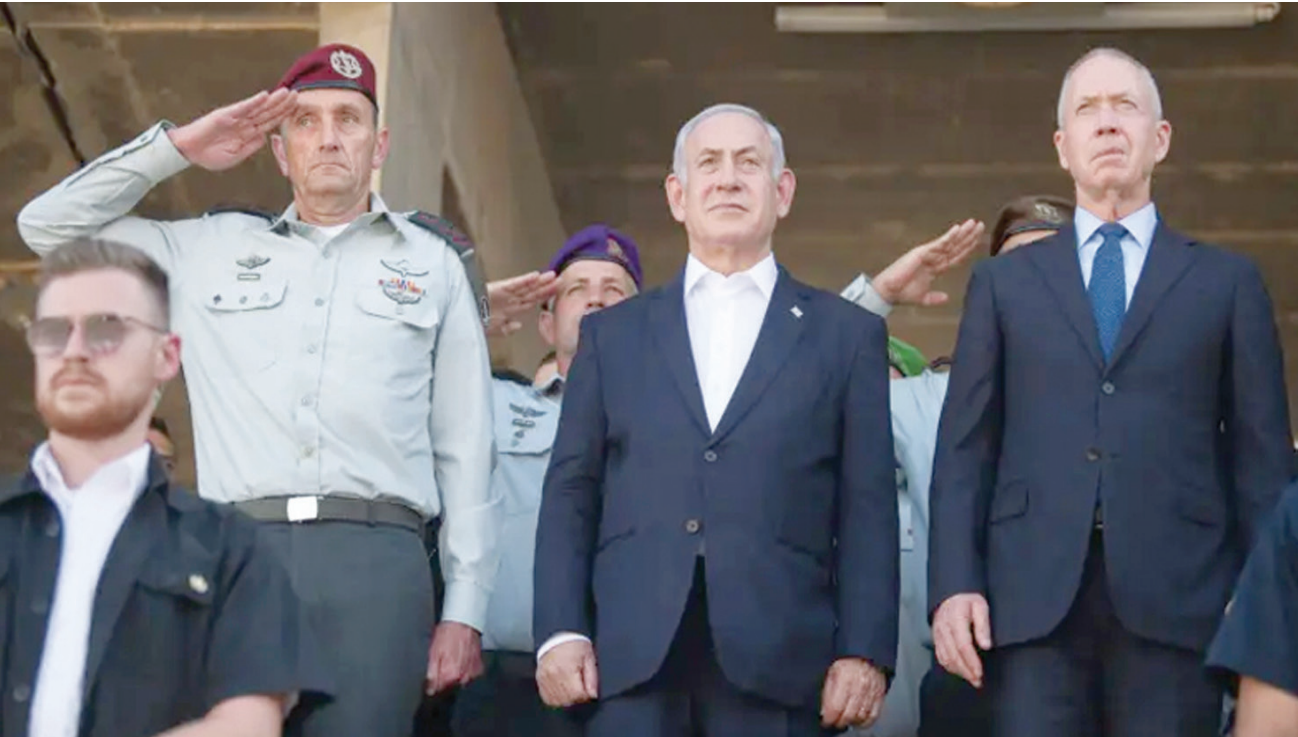
نتنياهو ومتوسطاً غالات ورئيس الأركان هليفي (الجيش الإسرائيلي)

هناك من يرى أن اجتياح رفح مهمة ضرورية لا يجوز إنهاء الحرب من دون تحقيقها إذا أرادت إسرائيل الحسم القاطع ضد حركة «حماس»، لكن في المقابل هناك من يرى أنه حان الوقت للتخلي عن هذه الفكرة لأنها ستدخل إسرائيل في احتكاك وربما صدام مع الإدارة الأميركية ومصر والمجتمع الدولي، عوضاً عن أنها قد تورط الجيش الإسرائيلي في وحل غزة كغير في هذا الشأن داخل هيئة رئاسة أركان الجيش، بل حتى في قيادة اللواء الجنوبي الذي يتولى إدارة الحرب عملياً.