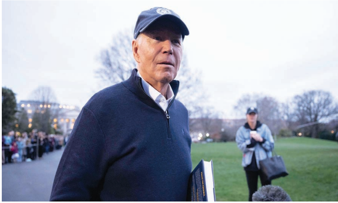
الرئيس الأميركي جو بايدن يتحدث للصحافة قبل مغادرته البيت الأبيض إلى المنتجع الرئاسي في كامب ديفيد بولاية ماريلاند الجمعة (أ.ف.ب.)