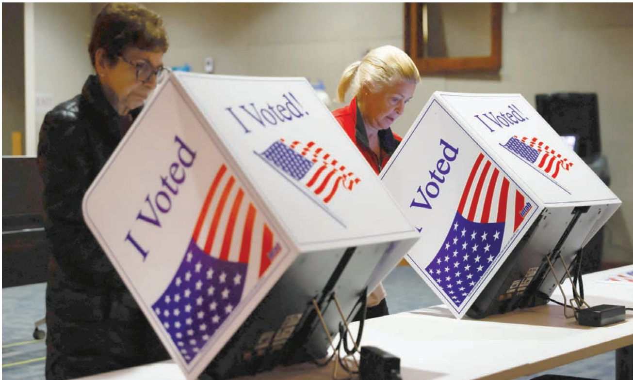
واشنطن: إيلي يوسف

تدخل الانتخابات التمهيدية الأميركية غداً مرحلة جديدة، مع قيام ناخبي الحزبين الديمقراطي والجمهوري فيما يسمى «الثلاثاء الكبير»، باختيار عدد كبير من مندوبي الولايات الـ15، لمؤتمراتهم الحزبية التي ستعقد في الصيف المقبل. ويعد ما من شبه المؤكد أن السباق الرئاسي، الذي يعد هذا العام أحد أكثر السباقات توتراً في تاريخ الولايات المتحدة، سيكون نسخة معادة لانتخابات 2020، بين الرئيس الحالي جو بايدن والرئيس السابق دونالد ترمب، تصاعد التحذيرات من دور منصات التواصل الاجتماعي في التعامل مع المعلومات المضللة، ومن الذكاء الاصطناعي الذي تصاعد دوره في ابتكار وتوليد قصص ومقاطع فيديو، وحتى مكالمات هاتفية مزيفة.