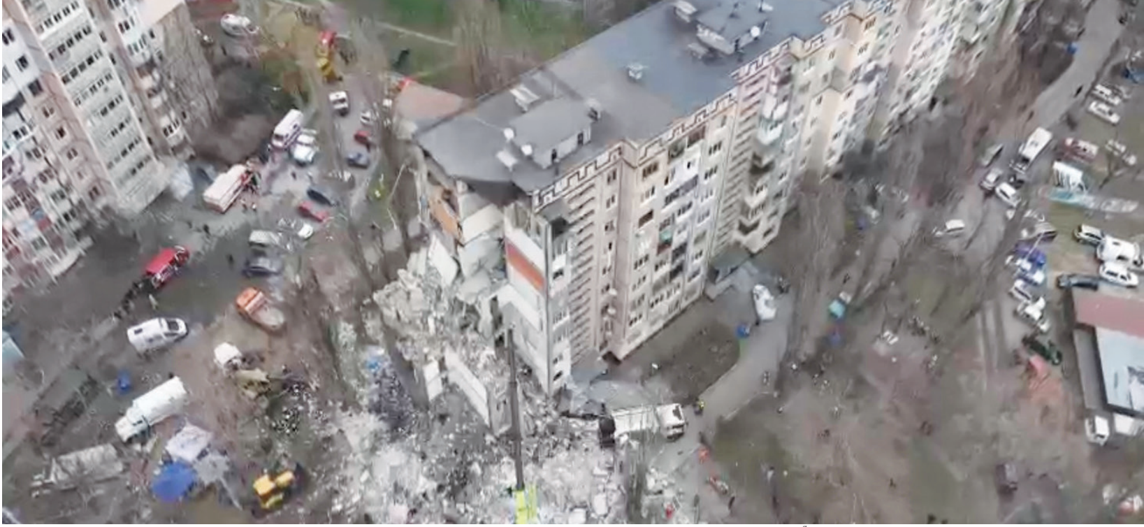
منظر جوي يظهر المبنى السكني الذي استهدفه هجوم بطائرة مسيرة وحُفقت قتلى في أوديسا السبت

وقال زيلينسكي إن 215 من مستجيبين الطوارئ شاركوا في عملية البحث والإنقاذ المستمرة في أوديسا. وأكد أن الهجوم أظهر