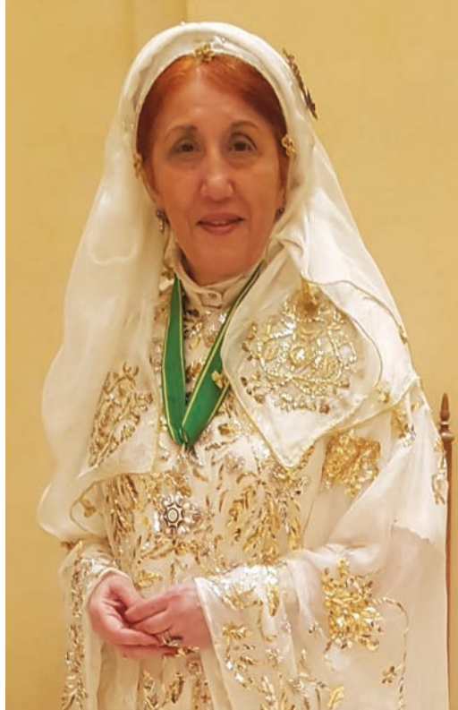
الفنانة السعودية صفية بن زقر

وُلدت صفية بن زقر في قلب مدينة جدة القديمة عام 1940، وكان المدينة العتيقة بمبانيها وقاطنيتها قد تسربت إلى روحها مع أنفاسها الأولى، فنشأ بينهما رباط وثيق اشتد قوة مع مرور