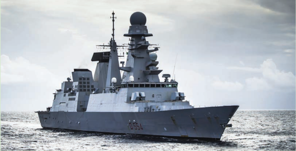
مدمرة إيطالية في البحر الأحمر ضمن قوات أوروبية للتصدى لهجمات الحوثيين ضد السفن