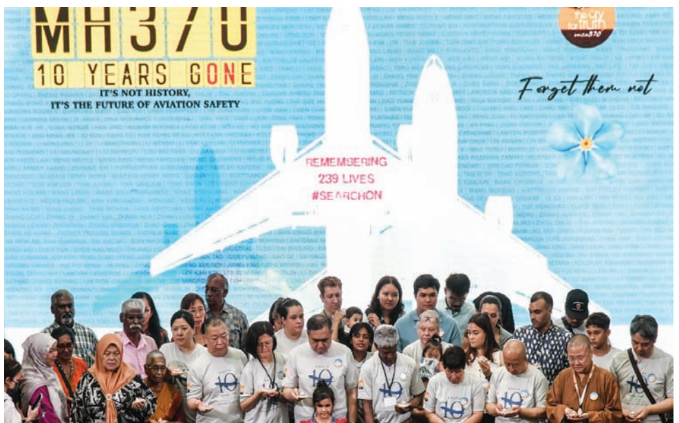
أهالي ضحايا الطائرة الماليزية المخفية رفقة وزير النقل الماليزي في كوالالمبور أمس (إ.ب.أ)

بالعدالة لابني. أين الطائرة؟» بسدوره، أكد وزير النقل الماليزي، أنتوني لوك، لصحافيين أن «ماليزيا عازمة على العثور على الطائرة. والتكلفة ليست المشكلة».