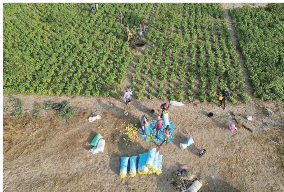
تحقيق الأمن الغذائي في أفريقيا يستلزم ضمان توفير أغذية آمنة

وفي محاولة لمواجهة هذه التحديات، حددت الدراسة، التي نشرت في العدد الأخير من دورية «نيشور إيرث أند إنفايرنمنت»، 5 حلول علمية لإحداث ثورة في النظم الغذائية في أفريقيا، ومعالجة الحاجة الملحة لمكافحة الجوع،