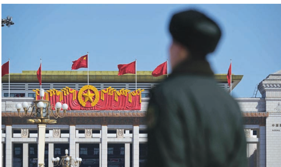
المتحف الوطني الصيني في بكين استعداداً للاجتماعات التشريعية السنوية للبلاد

وقال وو، الأستاذ المشارك في كلية لي كوان يو للسياسة العامة في سنغافورة والصحافي السابق بالصين: «الجميع يعلم أن الإشارة هي القمة. بمجرد أن تقول القمة شيئاً، أقول شيئاً». بمجرد أن تصمت القمة،