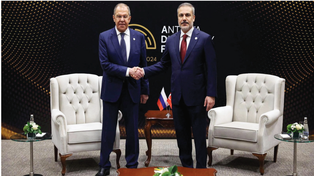
جانب من لقاء وزير الخارجية التركي والروسي في أنطاليا يوم الجمعة

وأوضح فيدان أنه بحث مع نظيره الروسي سيرغي لافروف، خلال لقائهما (الجمعة) على هامش أعمال المنتدى، عدداً من القضايا، في مقدمتها تطورات الحرب الروسية الأوكرانية، وسبل استئناف اتفاقية الممر الآمن للحبوب في البحر الأسود، فضلاً عن القضايا الإقليمية والدولية وبينها الأوضاع في غزة، والملف الفلسطيني، والأوضاع في ليبيا واليمن وجنوب القوقاز. وجاء لقاء فيدان ولافروف قبل زيارة من المقرر أن يقوم بها وزير الخارجية التركي إلى واشنطن،