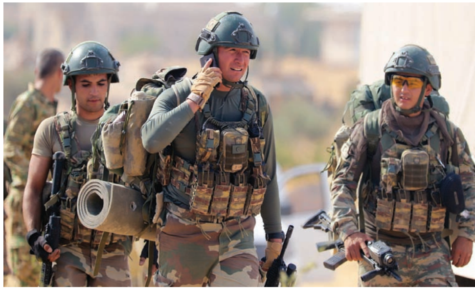
أرضية لجنود أتراك داخل الأراضي السورية

فیدان: هناك حاجة للحديث عن عودة اللاجئين وكتابة الدستور السوري الجديد