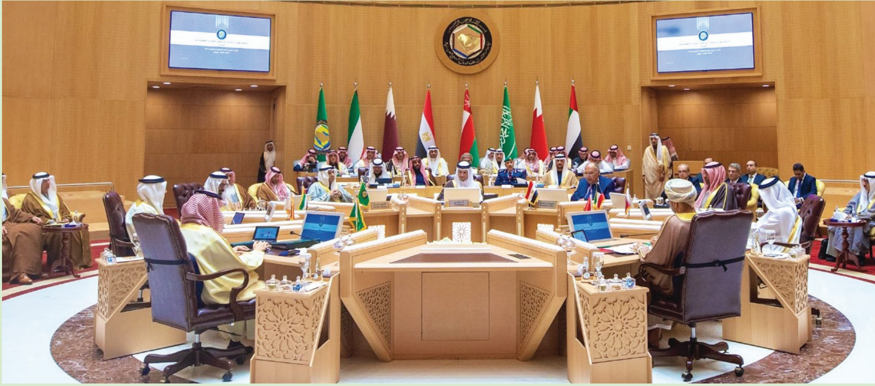
جانب من الاجتماع الوزاري لدول الخليج مع وزير الخارجية المصري في الرياض (واس)

وأكد سائح شكري وزير الخارجية المصري أن «الحرب في غزة ألقت بظلالها على أمن المنطقة ككل، وأمدت التصعيد في غزة إلى البحر الأحمر وباب المندب»، وأضاف ما يجري في قطاع غزة اليوم «المخطط المنهج لتصفية القضية الفلسطينية»، وشدّد شكري، خلال كلمته في الاجتماع، على أن «الحلول الأمنية للصراع لم تقدم للمنطقة سوى الدمار»، وأن الصراع القائم لا حل له إلا «بإقامة دولة فلسطينية». من جانبه، نوّه وزير الخارجية المغربي، ناصر بوريطبة، بأهمية هذا الاجتماع، وعُدّه «فرصة للتباحث في مسار الشراكة الاستراتيجية القائمة منذ 2011، وللشاور والتنسيق حول القضايا الإقليمية، في ظل استمرار