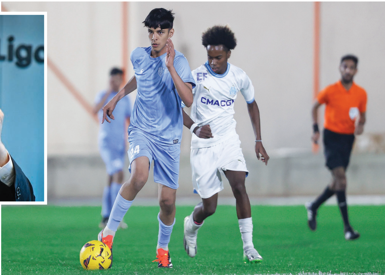
من مباراة «أكاديمية مهد» ضد مرسيليا الفرنسي في بطولة «لا ليغا» الدولية بالرياض (الشرق الأوسط)

تيباس رجح أن يكون هناك ناقل حصري لكل بلد بحسب ما يتوصلون إليه من دراسة في هذا الجانب