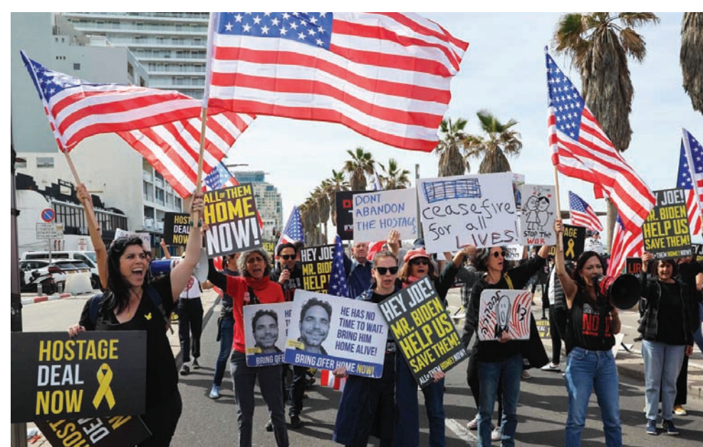
أقارب لرهائن إسرائيليون تجمعوا أمام السفارة الأميركية في تل أبيب الجمعة لمطالبة بايدين بالتدخل للتسريع بصفقة تبادل الأسرى

لكن دعوة غانتس إلى واشنطن تفسر على أنها خطوة راديكالية لأنها تعد تدخلاً أميركياً في السياسة الإسرائيلية، مع توجيه رسالة مفادها أنه يجب تغيير نتيهاو بغانتس. يذكر أن غانتس تلقى دعوة