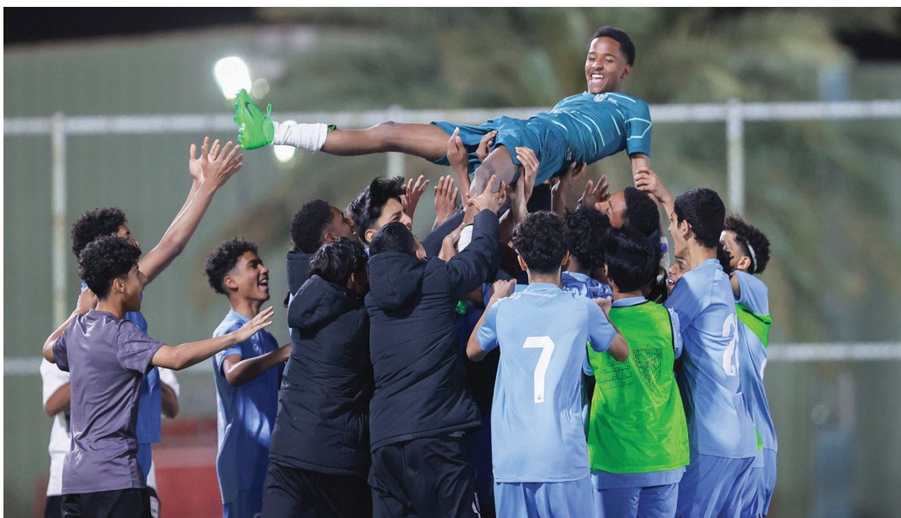
تيباس أكد أنهم يصدون صناعة لاعبين سعوديين عظماء مستقبلاً (الشرق الأوسط)

كتيبة رونالدو تسعى لمصالحة جماهيرها ووضع قدم في دور الأربعة