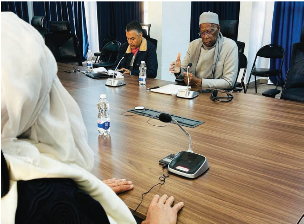
عبد الله باتيلي المبعوث الأممي في لقاء سابق مع نشطاء من جنوب ليبيا

15 عاماً من العمل مع الأمم المتحدة في العراق ولبنان وليبيا والسودان وسوريا واليمن. وشغلت أخيراً منصب مدير الشؤون السياسية في بعثة الأمم