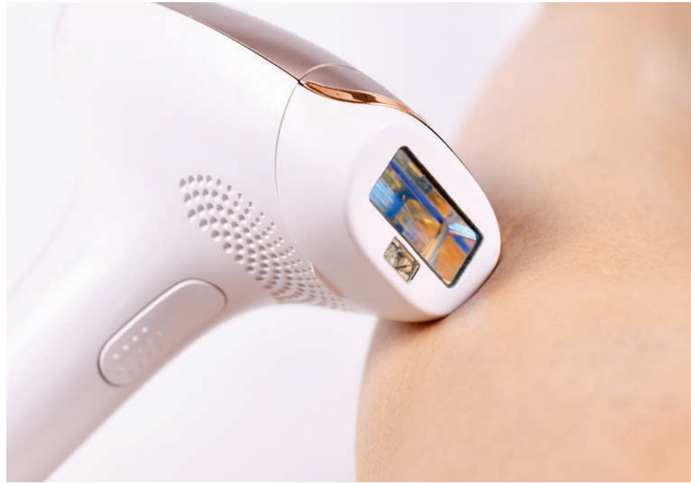
جهاز منزلي بالليزر لإزالة الشعر

عندما تشترون واحدة منها، ستقرأون تعابير «تقنيات طفيفة» و«علاج مصابيح الليد LED». وفيما يلي معاني هذه المصطلحات والمكاسب التي تقدمها.