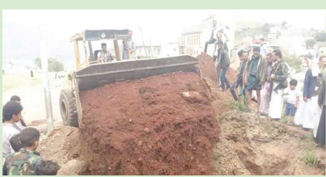
استعدادات حوثية في إحدى المقابر بمدينة إب اليمنية

وتداول ناشطون من إب صوراً على منصات التواصل الاجتماعي توثق جريمة التعدي على حرمة المقبرة، مؤكداً أن ذلك العبث وقع