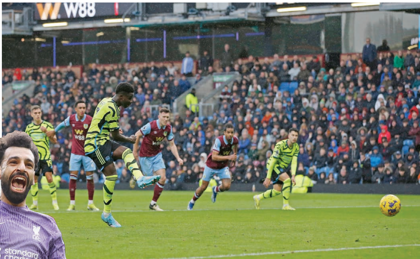
بوكايو ساكا والهدف الثاني لآرسنال

وصمد فيلا أمام ضغط فولهام ليحقق فوزاً مستحقاً، ويتقدم للمركز الرابع برصيد 49 نقطة، ويقي فولهام في المركز 12 برصيد 29 نقطة.