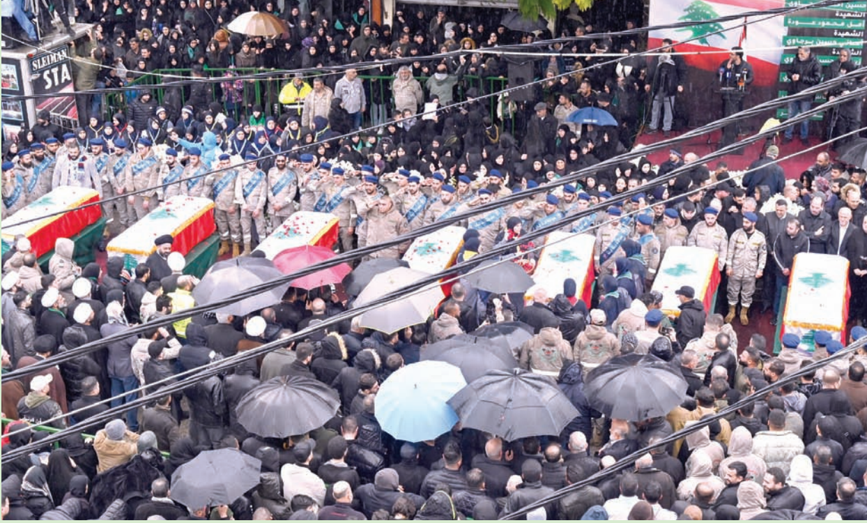
غزة - ميونيخ: «الشرق الأوسط»

يتمادى الوجود الفلسطيني المفتوح منذ بدء «الطوفان» لبعيش الغزيون في ثلاثية يومية: قصف وجوع وتهجير، مع ارتفاع عداد الموت والهواجس، فيما البحث جارٍ عن هدنة ولو مؤقتة، لتبادل الرهائن بالتهنئة، عسى تفتتح على حلحلة لمازق الجمع، فيبقى معبر رفح بخط واحد: لإدخال حافلات المساعدات لا لخروج اللاجئين الهارين. وعلى صدى قصف إسرائيلي عنيف أوقع عشرات القتلى، كان وزير الخارجية الأميركي أنتوني بلينكن يكرر الكلام عن أن حل الدولتين وإنشاء دولة فلسطينية مستقلة هو السبيل للخروج من دائرة العنف، قائلاً في مؤتمر ميونيخ للأمن: «اعتقد أن هناك فرصة استثنائية أمام إسرائيل في الشهر المقبل لإنهاء تلك الدائرة مرة واحدة وإلى الأبد».