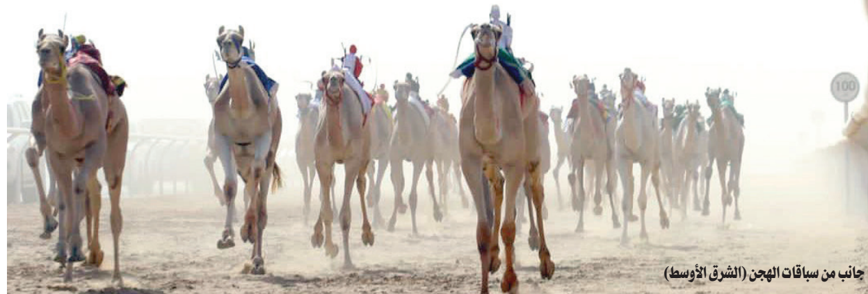
جانب من سباقات الهجن

تحت رعاية خادم الحرمين الشريفين الملك سلمان بن عبد العزيز ونيابة عن الأمير محمد بن سلمان ولي العهد رئيس مجلس الوزراء، يحضر الأمير فيصل بن بندر أمير منطقة الرياض، مساء غد الأحد الحفل الختامي لمهرجان خادم الحرمين الشريفين للهجن في نسخته الأولى بالجندارية. وانطلقت النسخة الأولى من المهرجان الذي ينظمه الاتحاد السعودي للهجن في الثامن من شهر فبراير (شباط) الحالي على أرض «درة الميادين»