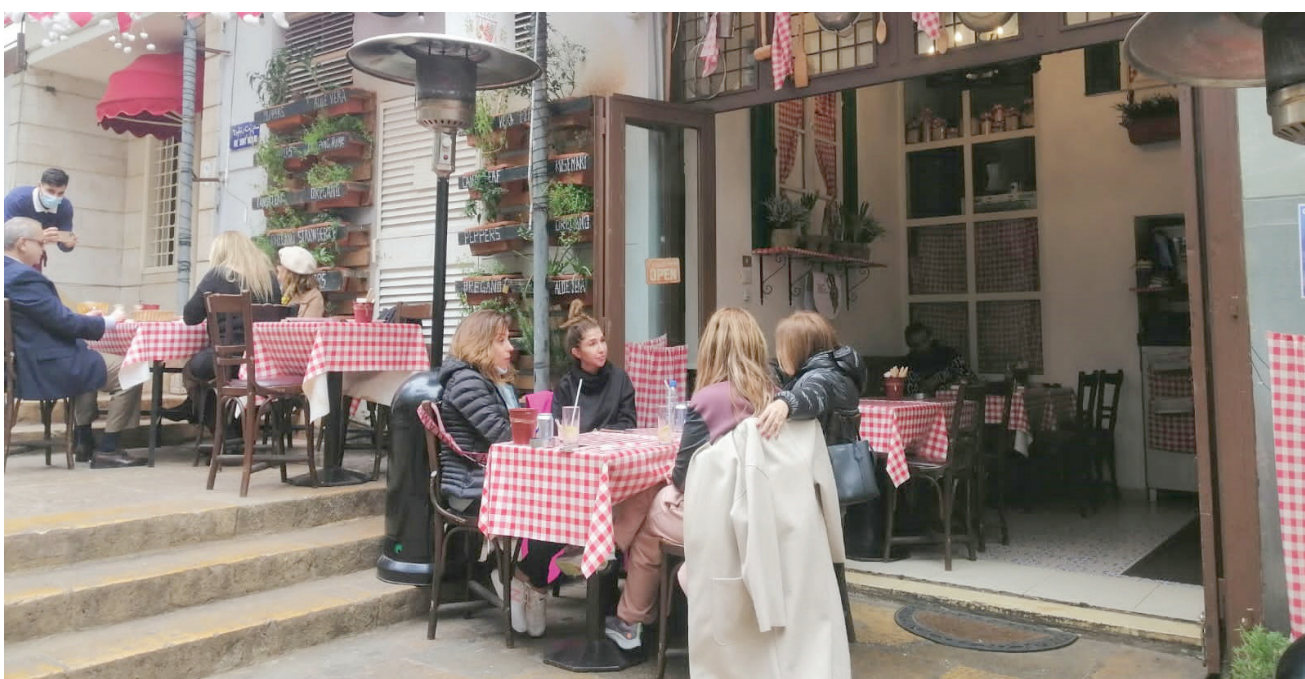
يقصد المطعم عشاق النكهات الإيطالية والباحثون عن تمثّل الجلسة (صور الشيف)

«التيراميسو» من ألد ما تجده على لألحة المطعم فيقدم ساخناً الى جانب «الآيس كريم»