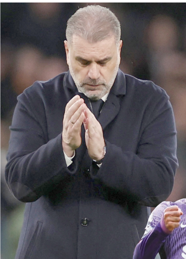
يوستيوغلو مدرب توتنهام ومرارة الهزيمة (رويتزر)