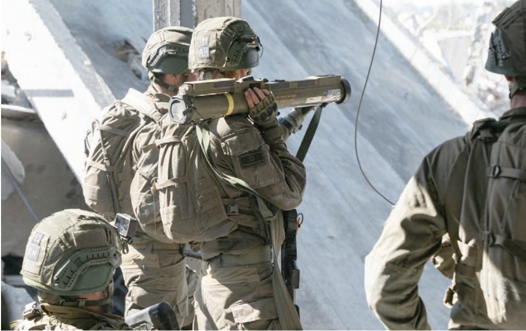
جنود إسرائيليون خلال عمليات في قطاع غزة أمس السبت

وليس رئيس الوزراء فقط. وكان نتنياهو قد قرر يوم الأربعاء، عدم إعادة الوفد الإسرائيلي إلى القاهرة، للمشاركة في المفاوضات من أجل إطلاق سراح المختطفين، وبدلاً من ذلك أعلن مواصلة القتال. وذكر ديوان رئيس الوزراء أنه لم يتم طرح أي اقتراح جديد من «حماس» في القاهرة، ورغم طلب الوسيط المصري العودة إلى طاولة النقاش، فإنه لا يوجد سبب للقيام بذلك ما دامت الحركة «لا تتراجع عن مطالبها الوهمية». وتم إبلاغ غانتس وآيزنكوت وغالات بالقرار بآثر رجعي. وتناقضت الخلافات على خلفية أن جهازي «الموساد» و«الشاباك» والجيش وضعوا خطة جديدة لإطلاق سراح المختطفين، غير أن نتنياهو رفض الخطة فوراً ومن دون التشاور مع غانتس وآيزنكوت وغالات.