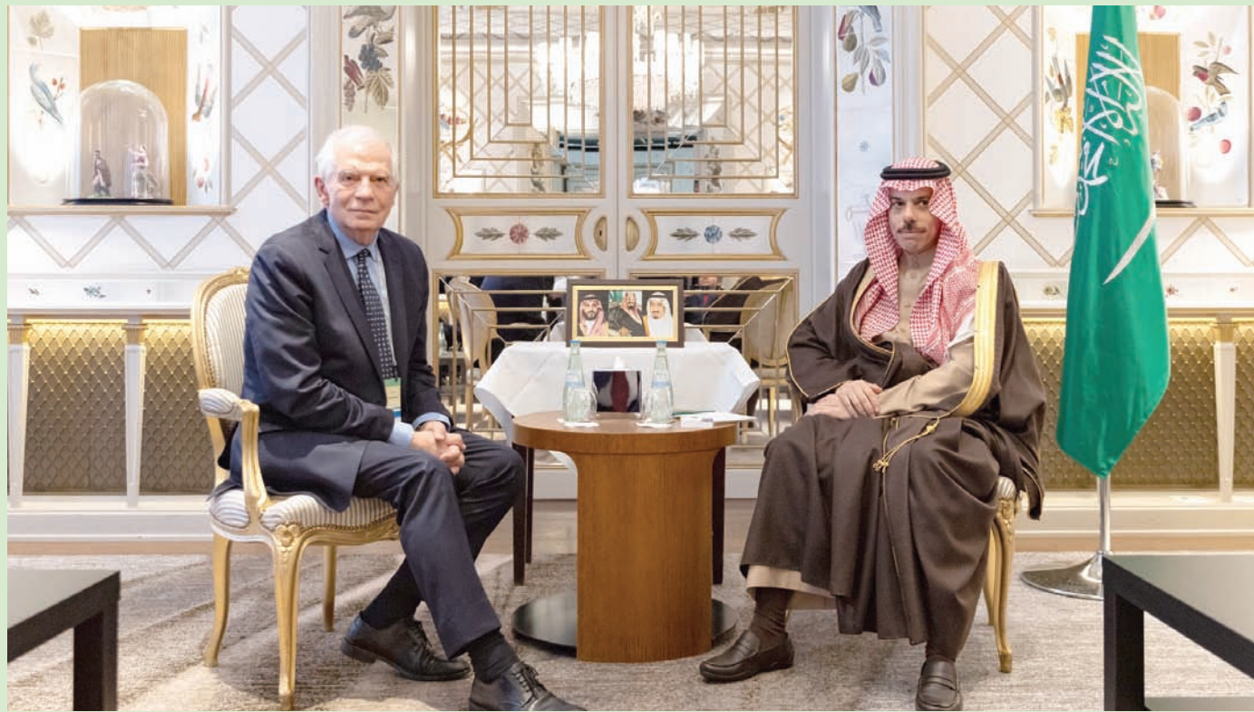
فيصل بن فرحان خلال اجتماعه مع جوزيب بوريل في ميونيخ

وأشار وزير الخارجية السعودي إلى أن بلاده لا تتحدث مع إسرائيل مباشرة، لأنه ليست لديها علاقات معها، ولكنها أبلغت عبر الأميركيين «أن الأولوية القصوى هي لمعالجة الأزمة الإنسانية، وإنهاء النزاع...».