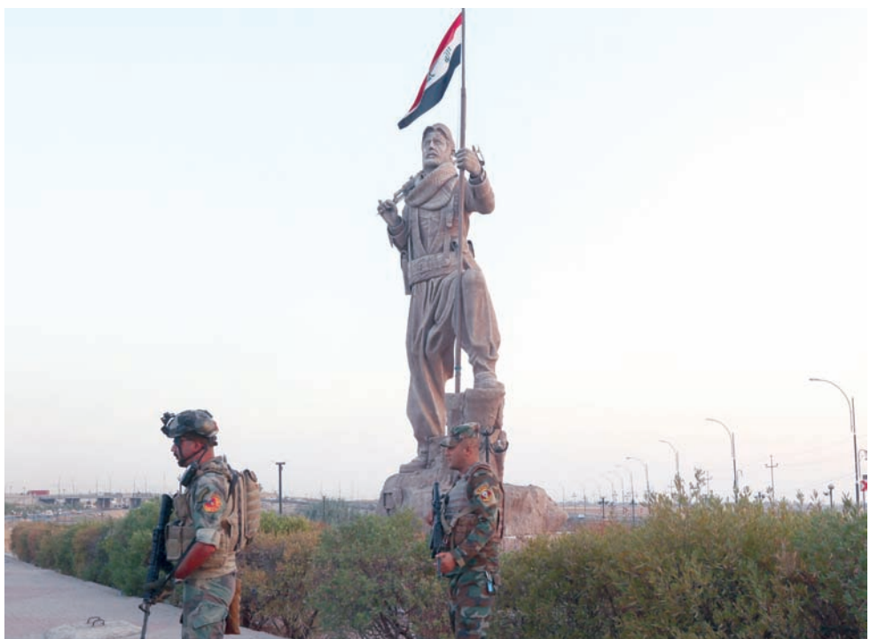
عصران من قوات الأمن العراقية بالقرب من تمثال للبيشمركة في كركوك سبتمبر الماضي

وفي المقابل، يصر العرب على بقاء المنصب الذي حصلوا عليه بعد تلك العمليات في أيديهم، وبينما يتمسك كل طرف بمطالبه، تأتي نتائج الانتخابات المتقاربة لتزيد الأمور تعقيداً، وتفتح الطريق أمام