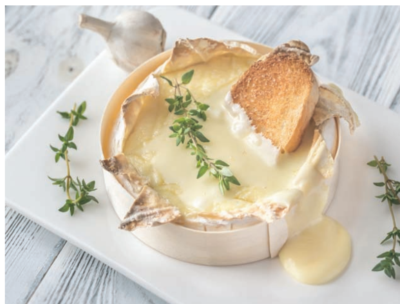
بياع الكامومبير في علب من الخشب للحفاظ عليه أثناء التنقل والسفر