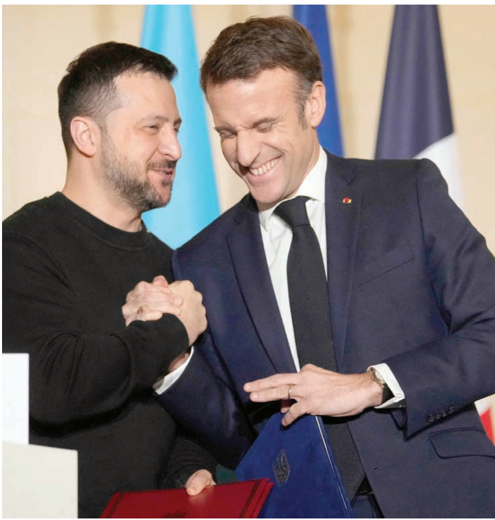
إيمانويل ماكرون وفولوديمير زيلينسكي يتصافحان بحرارة بعد التوقيع على الاتفاقية الأمنية المشتركة

أوكرانية» مستخدمة قادرة على الدفاع عن أوكرانيا وتزويدها بمنظومات حديثة برًا وبحراً وجواً وفضائياً وفي المجال السبراني مع التركيز على الدفاعات الجوية والمدفعية