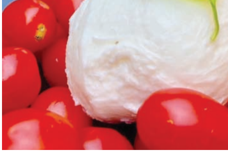
«بوراتا» إيطالية أصلية (استغرام)

المناطق، والسياح والمغتربون، على الكراسي المتواضعة، والصحون أمامهم على طاولات تلحف شرشف الأحمر والأبيض، تنتظر أن تُملأ بما