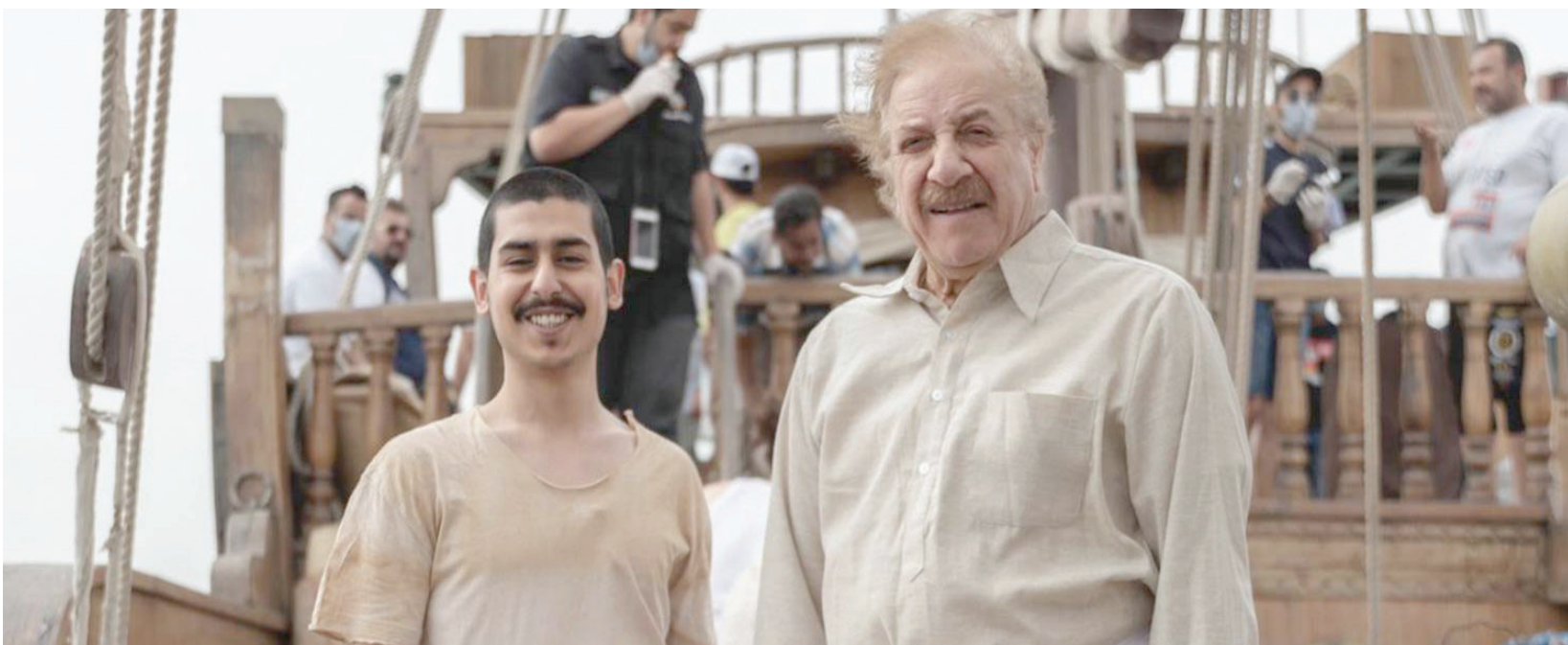
المنصور في لقطة من مسلسل «محمد علي روه»

ويعد فيلم «القادسية» أحد الأعمال المهمة في مسيرته الفنية وإحدى أيقونات السينما العربية، وحول كيفية مشاركته به، قال إن