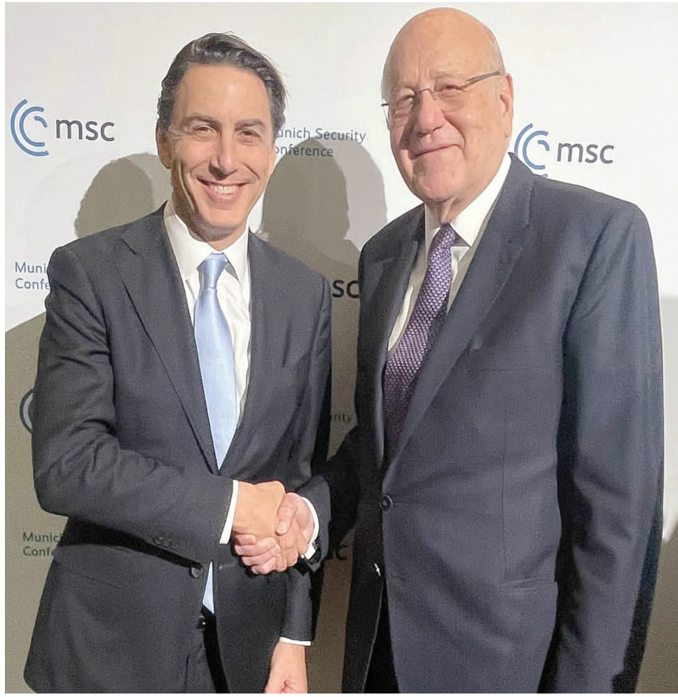
رئيس حكومة تصريف الأعمال نجيب ميقاتي ومستشار الرئيس الأميركي أموس هوكستين خلال لقائهما أمس

وجود مؤتمر جامع. أما النقطة الثانية التي يجري البحث فيها فهي ما إذا كان سيُسفَى مرشح من قبل اللجنة الخماسية بعد التشاور مع الأطراف اللبنانية أم لا. وأخيراً تبقى النقطة الثالثة المحورية وهي العقوبات التي قد تُفرض على المعرقلين والمدة الزمنية التي قد تُعطى للقيادات اللبنانية قبل التلويح بالعقوبات، مشيرة إلى