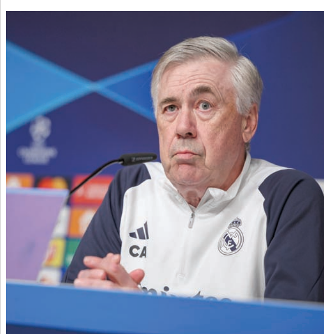
كارلو أنشيلوتي مدرب ريال مدريد

ورغم تصدر كين ترتيب الهادفين في الدوري برصيد 24 هدفاً في 21 مباراة حتى الآن في انطلاقة مثالية منذ وصوله إلى بافاريا مطلع الموسم الحالي، فإنه فشل في هز الشباك في