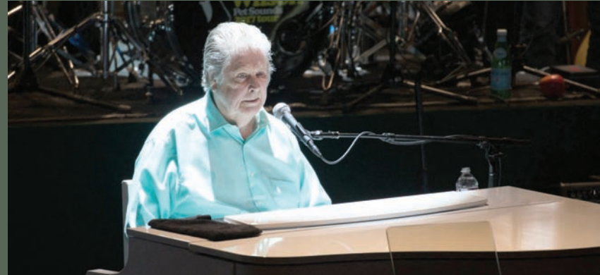
تقلبات الأعمار تخذل العزف