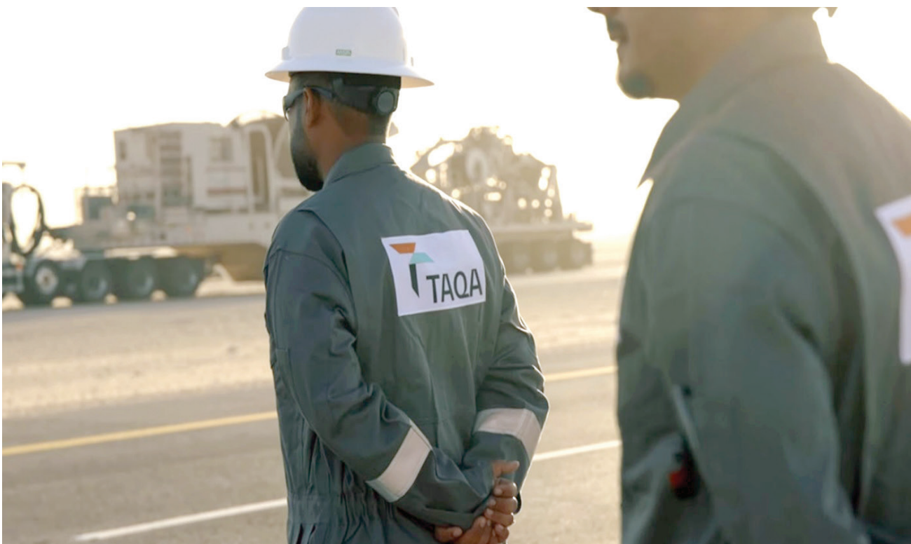
فيان في موقع تابع لشركة «طاقة» السعودية