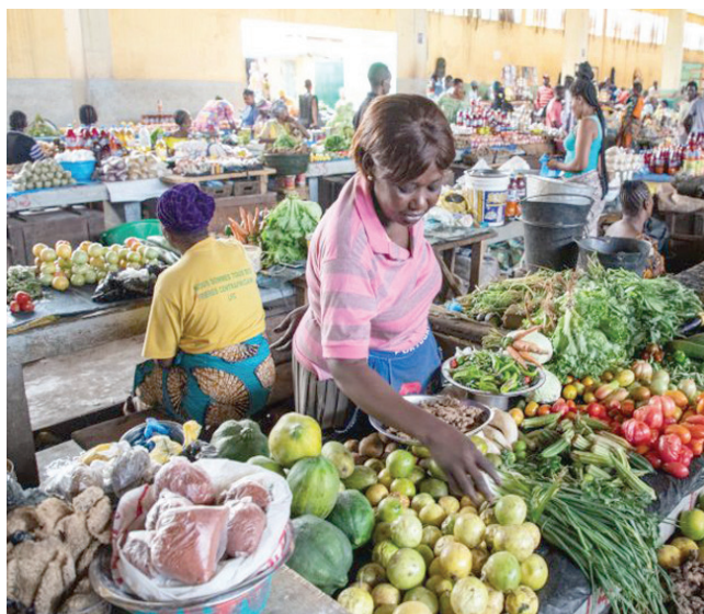
سوق مركزية في باتني بجمهورية أفريقيا الوسطى

ومؤخراً، تدهورت معنويات المستثمرين في الصين بسبب أزمة العقارات المستمرة والإنفاق الاستهلاكي الأضعف من المتوقع، مما خلق حالة من عدم اليقين بشأن الاقتصاد وشجع البنك المركزي على إبقاء السياسة النقدية أكثر مرونة من نظرائه العالميين.