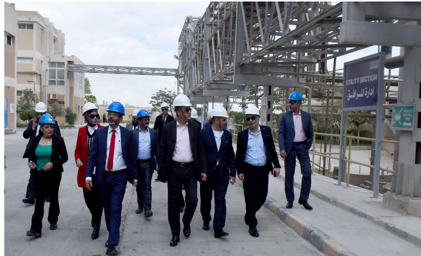
رئيس هيئة الاستثمار المصرية خلال جولة على المناطق الحرة في محافظة السويس لمتابعة توسعات الشركات العاملة

قيمة استثمارات الشركة وأصولها بمصر حالياً حوالي مليارى جنيه، لتصبح أكبر منتج لـ(الجبن بورد) في مصر»، وفق البيان.