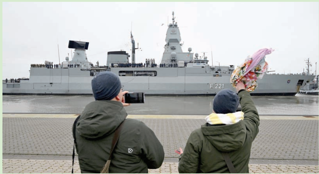
فرقاطة ألمانية متجهة إلى البحر الأحمر للمشاركة في التصدي للهجمات الحوثية ضد سفن الشحن

وقال إعلام الجماعة الحوثية، إن غارة أميركية بريطانية ضربت (عصر السبت بتوقيت صنعاء) موقعاً بالقرب من ميناء رأس عيسى في مديرية الصليف على بعد نحو 70 كيلومتراً إلى الشمال من مدينة الحديدة التي حولتها الجماعة إلى قاعدة عسكرية لمهاجمة السفن