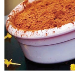
«التيراميسو» من أشهر أطباق المطعم