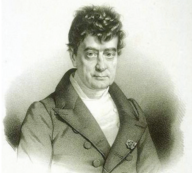
أنطوان سيلفستر داساسي

أخص الاستشراق الألماني بذكر طيب؛ إذ انفرد بميله الأكاديمي الضرف ورغبته الصادقة في الانعقاد من سلطة السلطان السياسي. صحيح أنه من العلوم الدخيلة في ألمانيا، ولكنه ما عثم أن اندمج في النظام البحثي الجامعي الألماني، وقد أزرته العوامل السياسية المتعلقة بانكفاء المقاطعات الألمانية وإعراضها عن التوسع الاستعماري الجامع. فافتقى المستشرقون الألمان بفضيلة البحث العلمي المحض، ولو أن الجيل الرومانسي من الاستشراق الألماني عاد فاستمر لاحقاً الأبحاث المنجزة في توطيد التصورات القومية الألمانية. بفضل جهود المستشرق الألماني هاينريش فلاشر (1801 - 1888) الذي اعتنى بتحقيق نصوص أبي الفداء والزمشري والقاضي البيضاوي، تأسست في مدينة لايبنتشيتش عام 1845 الجمعية المشرقية الألمانية، وغايتها احتضان الاستشراق الألماني في إطار المؤسسة البحثية المستقلة.