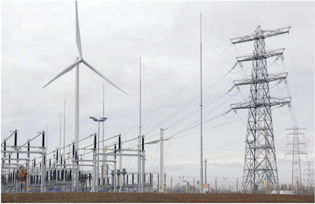
أبراج الطاقة الكهربائية عالية التوتر ومحطة ومحولات وتوربينات الرياح في نيميفين - هولندا

مصادر الطاقة المتجددة ثلاث مرات ومضاعفة كفاءة الطاقة عالمياً بحلول 2030. ووفقاً للوكالة الدولية للطاقة، فإن زيادة قدرة الطاقة المتجددة العالمية ثلاث مرات ومضاعفة معدل كفاءة استخدام الطاقة بحلول سنة 2030 أمران بالغا الأهمية للحدّ من ارتفاع متوسط درجة الحرارة العالمية إلى 1,5 درجة مئوية.