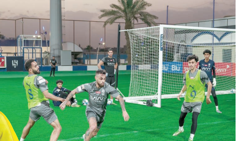
من تدريبات الهلال الأخيرة

سعى فريق الاتحاد لمصالحة جماهيره على الصعيد المحلي، وذلك عندما يلاقي نظيره الرياض في ختام منافسات الجولة العشرين من الدوري السعودي للمحترفين، وخسر الاتحاد مزيداً من