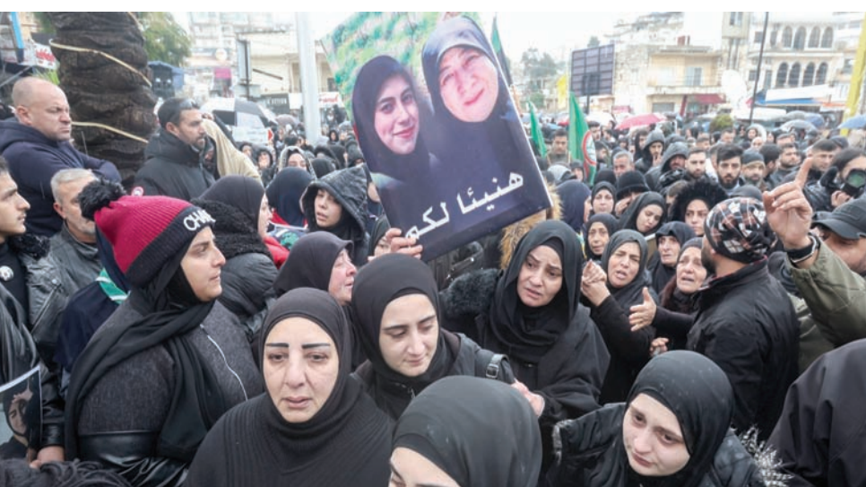
نساء مشاركات في تشييع أبناء عائلة براجوي الذين سقطوا في قصف منزلهم في النبطية يوم الأربعاء الماضي

وشدد الحاج حسن على أن «موقف المقاومة واحد، وأن عمليات المقاومة لنصرة غزة وإسناداً لمقاومتها الباسلة والشريفة لن تتوقف ما دام العدوان مستمراً على غزة»، وقال: «إن أي حديث عن لبنان، وعن الحدود الجنوبية مع شمال فلسطين المحتلة، ليس له مكان قبل وقف العدوان على غزة، وإن لجوء العدو إلى التهديد والتخويل، وإلى ارتكاب المجازر كما جرى في النبطية والصواريخ وغيرها من القرى طوال الأشهر الماضية، لن يغير في المعادلة، ولن يستطع أن يفرض المعادلات».