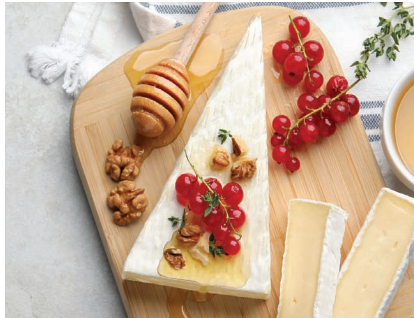
جبن البري لذيذ مع العسل