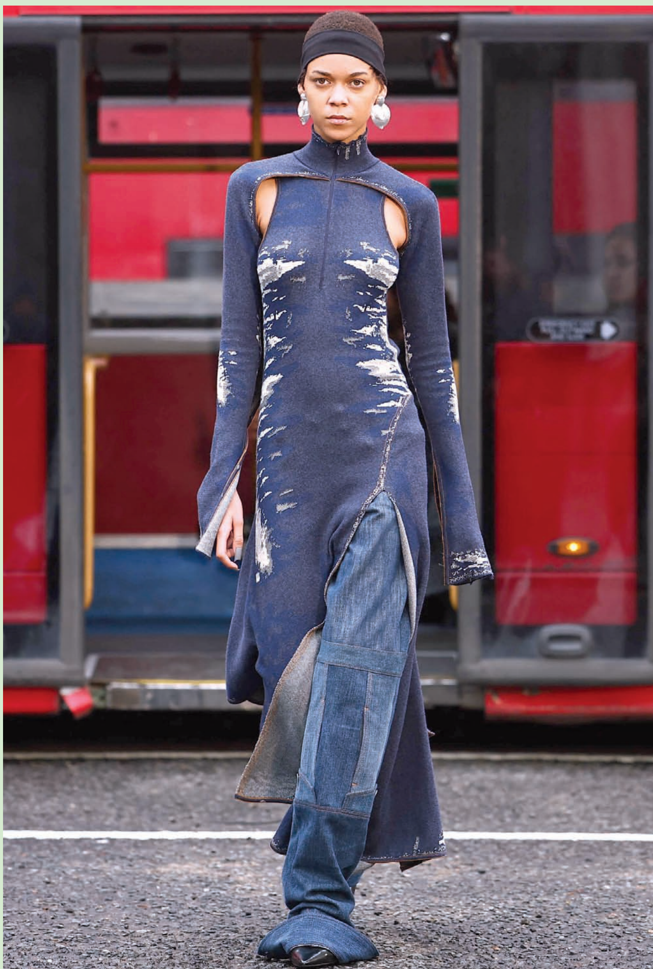
عارضة أزياء يزي من علامة «SRVC» ضمن مجموعة خريف وشتاء 2024 خلال أسبوع الموضة في لندن

إنني اعتقد ذلك بل وأجزم عليه، فالسائق الفرنسي والحماقة صنوان لا ينفصلان، وسبحان من خلق وفرق بين السائق الفرنسي الأهوج، والسائق الإنجليزي الذي يجلس وراء مقود السيارة وكأنه قالب تلج أبكم من شدة الأدب.