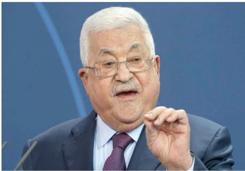
الرئيس الفلسطيني محمود عباس

وتحمل «فتح» إلى الحوار رؤية تقوم على توحيد السلطة الفلسطينية وتسلمها قطاع غزة بشكل كامل، بما في ذلك الأجهزة الأمنية، وتشكيل حكومة خبراء وليس حكومة توافق، وأن تكون مرجعيتها الرئيس الفلسطيني محمود عباس، ومسؤولة منه. وستعرض «فتح»، بحسب مصادر «الشرق الأوسط»، تشكيل لجنة للبحث انضمام «حماس» إلى