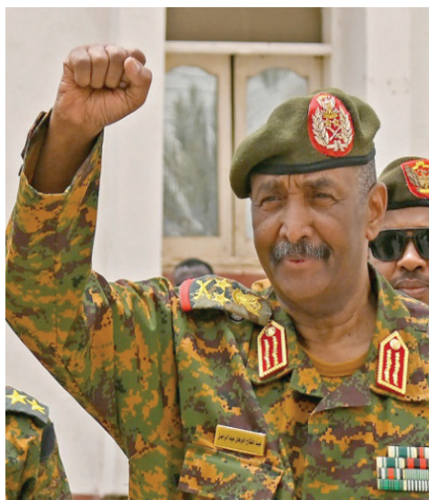
قائد الجيش السوداني الفريق عبد الفتاح البرهان

لـ«الشرق الأوسط»، زيارة البرهان تهدف إلى رفع الروح المعنوية وتحقيق انتصارات في المفاوضات مع قوات «الدعم السريع» بقيادة الفريق محمد حمدان دقلو الشهير باسم «حميدتي». وبحسب المصادر ذاتها، فإن تحقيق الجيش انتصاراً عسكرياً حاسماً «هدف بعيد المنال». ووفق الخريطة الميدانية للوجود العسكري لطرفي القتال، لا تزال قوات «الدعم السريع» تفرض سيطرتها بشكل تام على كل المناطق السكنية والحيوية في مدينتي بحري والخرطوم، بما في ذلك مركز المدينة وأحيائها الشرقية والجنوبية، بينما بدأت قوات الجيش بالتقدم عسكرياً على الأرض في أمدرمان. وكان نائب البرهان في مجلس السيادة السوداني، مالك عقار، أكد أن الجيش يتقدم في أمدرمان ونفذ ضربات نوعية ضد قوات «الدعم السريع» التي تسيطر منذ أشهر على 4 ولايات في إقليم دارفور غرب البلاد.