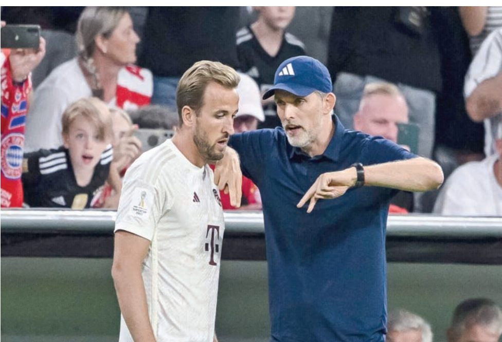
توخيل يطالب بايرن ببدل المزيد لجعل كين راضياً

المحربين لدينا يمثل البحث النظيف ولديه كامل تقننا». الأجزاء داخل غرفة خلع الملابس بايرن قبل مباراة بوخوم في بايرن بفارق خمس نقاط عن باير ليفركوزن المتصدر، وخسر الفريق مباراة الذهاب في دور ال16 ببطولة دوري أبطال أوروبا، أمام لاتسيو الإيطالي بهدف نظيف. وقال توخيل: «إنه وضع غير عادي. الحالة المزاجية غير جيدة لأننا كنا نتوقع ردة فعل أفضل من أنفسنا. الخسارة في مباراة الذهاب ما زال يمكن تعويضها. لم نخرج من دوري أبطال أوروبا».