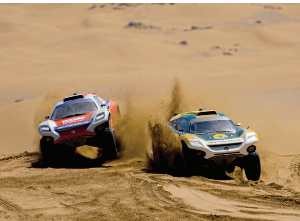
صراع مثير شهدت منافسات اليوم الأول