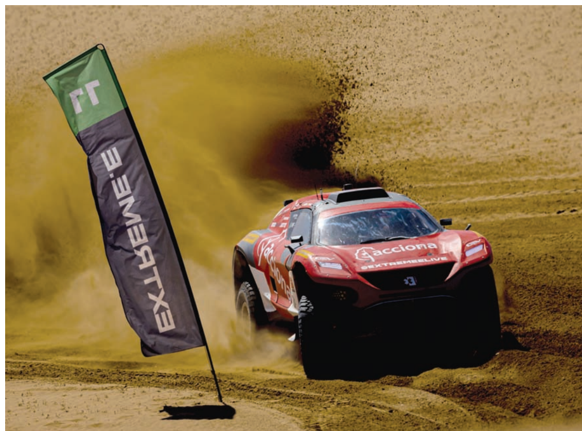
المتسابقون سيتنافسون اليوم الأحد على حصد جائزة السباق النهائي

و10 دقائق عصراً، وسيشارك فيه الفرق الأربعة الأخرى. الجدير ذكره أن سباق «ديزرت إكس برى»، يعد واحداً من أهم الأحداث المتميزة في روزنامة سباقات «إكستريم إي»، بوصفه السباق الوحيد الذي يقام وسط الكثبان والتضاريس الرملية، بالإضافة إلى كونه متوافقاً مع الجهود العالمية الرامية إلى تحقيق الاستدامة البيئية، وتقليل الانبعاثات الكربونية، بما يتماشى مع مستهدفات رؤية السعودية 2030.