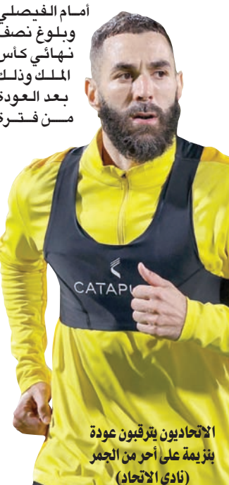
الاتحاديون يترقبون عودة بنزيمة على أحر من الجمر (نادي الاتحاد)

ويبدو أن اتحاد الرجبي يتجاوز الطائي في مواجهة موقعة من الجولة التاسعة عشرة، لكنه عاد من مدينة نمغان في الأوزبكية سلباً دون أهداف في ذهاب دور الستة عشر لبطولة دوري أبطال آسيا.