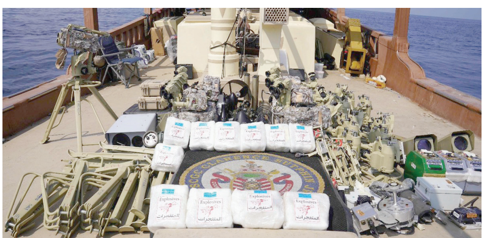
شحنة تتضمن مكونات أسلحة إيرانية متقدمة كانت في طريقها للحوثيين

ويعتقد خبراء غربيون أن إيران تتابع عادة في قدرات أسلحتها وأن الصاروخي، خصوصاً الصواريخ الباليستية طويلة المدى. مع ذلك، ذهب تقرير نشرته صحيفة «ول ستريت جورنال» إلى أن «صناعة الأسلحة الإيرانية تنمو