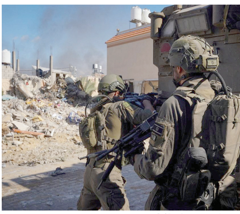
جنود إسرائيليون خلال العملية البرية في قطاع غزة

ويومج هذا القانون، سيجري تعديل الخدمة الإلزامية في الجيش للرجال أربعة شهور على الأقل، من 32 إلى 36 شهراً، وزيادة السقف الأعلى لعمر جندي الاحتياط من 40 إلى 45 عاماً، والضباط من 45 إلى 50 عاماً، وجنود المهامات الخاصة من 49 إلى 55 عاماً، كما تجري مضاعفة أيام الخدمة للجنود في جيش