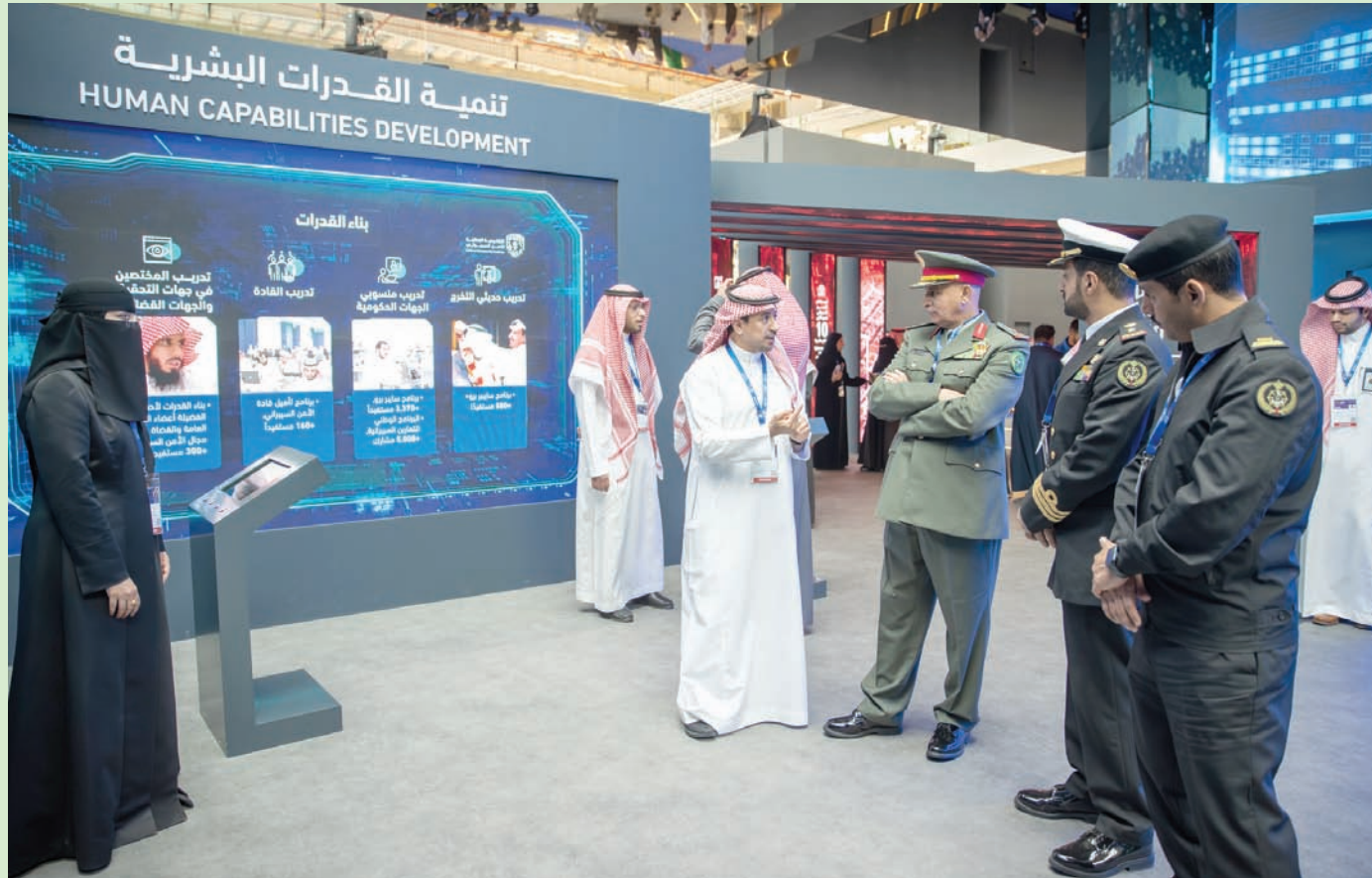
دربت «الأكاديمية الوطنية للأمن السيبراني» خلال العام الماضي أكثر من 6 آلاف مستفيد يمثلون أكثر من 300 جهة حكومية

ويبرز الركن الخاص بركيزة التنمية داخل جناح الهيئة في «معرض الدفاع العالمي 2024»، أبرز الجهود والمبادرات المنفذة لتنمية وبناء القدرات الوطنية المتخصصة في مجال الأمن السيبراني، ورفع مستوى الجاهزية السيبرانية لدى الجهات الوطنية، وخلق بيئة تنافسية تجذب الاستثمار المحلي والعالمي لسوق الأمن السيبراني في السعودية؛ حيث عملت الهيئة على إطلاق مجموعة من المبادرات الاستراتيجية ضمن برنامج «سايرك» لتنمية قطاع الأمن السيبراني، الذي يساهم في