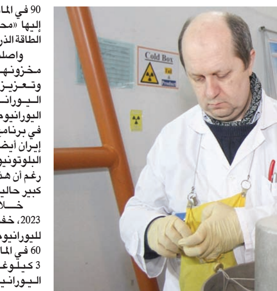
مفتش من وكالة «الذرية لدولية» يجري فحصاً في محطة نظير

كما يسلط المعهد على انتهاكات إيران لإتفاقيات الضمانات، الذي يشكل جزءاً رئيسياً من معاهدة حظر الانتشار النووي، لافتاً إلى خلافات نشبت بين إيران والوكالة الدولية بشأن عدد مرات التفتيش والوصول السريع إلى المواقع النووية الإيرانية،