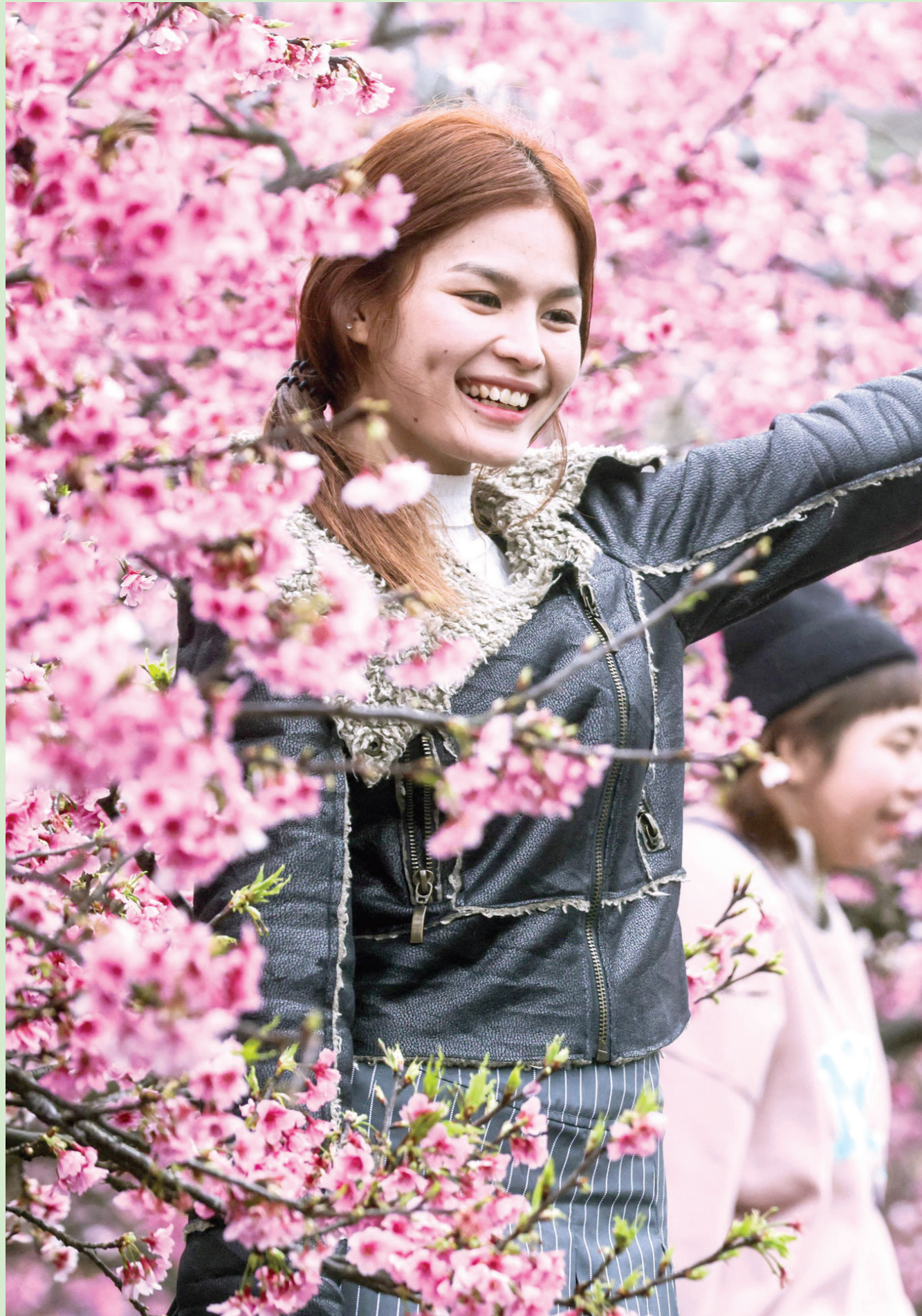
زائرة تلتقط صورة لها مع أشجار الكرز المزهرة بمهرجان الربيع في نايهو بتايبيه أس (أ.ف.ب)

هذه الثقافة الشاملة غير الجزئية، هي التي تكفل صناعة العقل الوافر، والعقل الوافر هو أعظم حصانة من الدعايات الجوفاء، وأخصب أرض لايتاب الجديد من الإبداع كل حين وأن. الثقافة ضرورة وليست ترفاً، أو حديثاً فارغاً، بهذا المعنى.