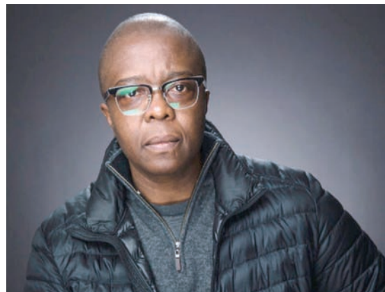
مخرج «قوة» يانس فورد (غورفيديا ميديا)