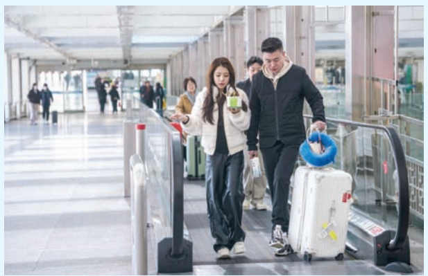
أرقام مؤشر أسعار المستهلك في يناير تخالف توقعات المحللين وتصل 0,8% (إ.ب.أ)

وتابعت: «نرى إمكانية كبيرة بان تمثل بيانات يناير أدنى مستوى للتضخم (من عام لآخر) في الدورة الحالية». وبينما يشير الانكماش إلى أن المنتجات أقل تماشياً، إلا أن الأمر يمثل تهديداً للاقتصاد الأوسع إذ يلجأ المستهلكون عادة لتأجيل عمليات الشراء على أمل انخفاضها أكثر. ويمكن لنقص الطلب بعد ذلك أن يجبر الشركات على خفض الإنتاج وتجميد التوظيف إلى تسريع عمال بينما قد تضطر أيضاً إلى خفض أسعار مخزونات موجودة لديها، ما يؤثر على الأرباح وازدواجت الأسعار على حالها.