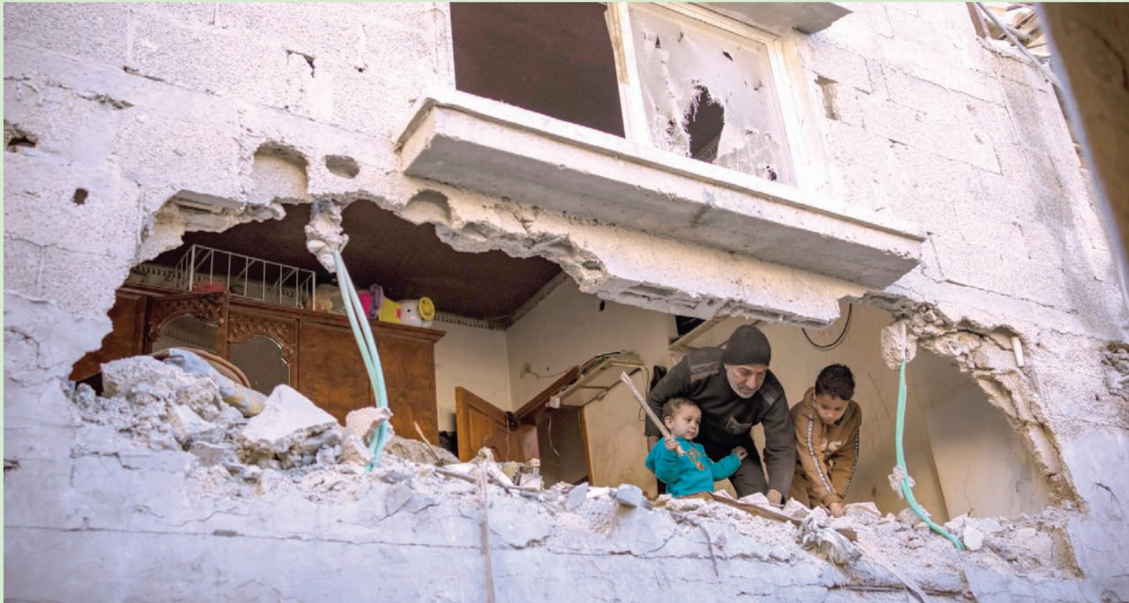
فلسطينيون يعاينون الدمار الناجم عن قصف إسرائيلي في رفح جنوب قطاع غزة أمس (أ.ب)

وينسلاند، من عواقب «كارتية» لأي هجوم إسرائيلي على رفح المكتظة بالمدنيين. وأشار إلى مناقشات مكثفة تجري بين إسرائيل ومصر حول ما يمكن القيام به على طول محور فيلادلفيا؛ وهو منطقة عازلة منزوعة السلاح على حدود غزة مع مصر، بموجب اتفاق السلام الإسرائيلي - المصري لعام 1979. وكشف وينسلاند، في مؤتمر صحفي نادر داخل المقر الرئيسي للأمم المتحدة في نيويورك، قبل أن يتوجه إلى واشنطن لعقد سلسلة اجتماعات مع المسؤولين في إدارة الرئيس جو بايدن، عن أن هذه المسألة كانت