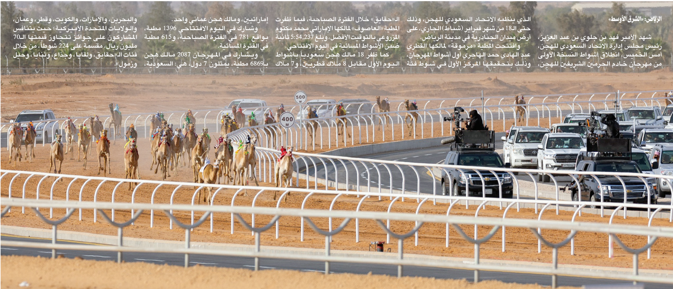
المهرجان انطلق وسط مشاركة خليجية ودولية (الشرق الأوسط)