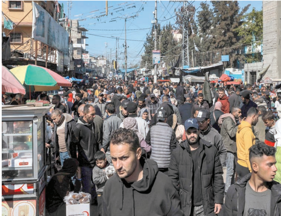
أحد شوارع مدينة رفح جنوب قطاع غزة مزدهم بالنازحين أمس وسط تواصل القصف الإسرائيلي

فيه الرئيس الفلسطيني على ضرورة وقف العدوان على غزة وإقامة دولة فلسطينية وأشد فيه بمواقف السعودية. وعبر أبو ردينة عن اطمئنان الفلسطينيين تجاه الموقف السعودي وإزاء تحركات الرياض وجهودها على الصعيد العربي والدولي.