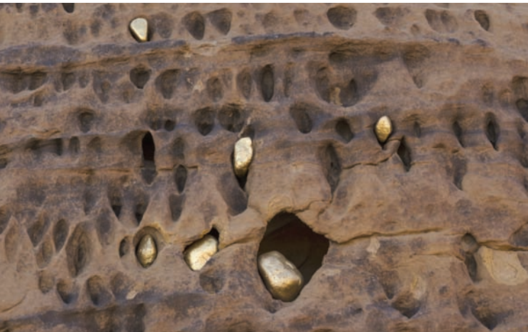
عمل ليوسكو سودي (الهيئة الملكية للعُلا)

«ديزرت إكس الغلا» في نسخته الثالثة يهدف إلى استكشاف الأفكار التي تدور حول ما لا تراه العين