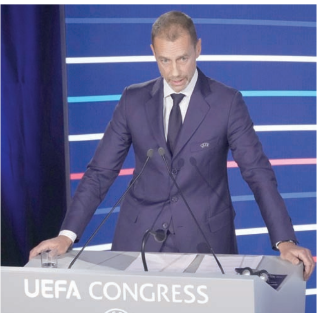
سيفرين أشار في مؤتمر «يويفا» إلى أنه سيكتفي بفترة حتى 2027

وبدأ من دور ال16 ستستمر المسابقة بنظام خروج المغلوب المعتاد حتى الوصول إلى المباراة النهائية في ملعب محايد. وتقام كل المباريات بمنصف الأسبوع كما هو معتاد، باستثناء النهائي يُقام في يوم السبت. وسيطبق «يويفا» النظام الجديد نفسه في مسابقتي الدوري الأوروبي ودوري المؤتمر أيضاً.