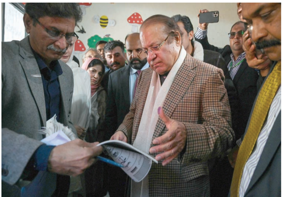
نواز شريف خلال الإدلاء بصوته في لاهور أمس

يتنافس نحو 18 ألف مرشح للفوز بمقاعد في البرلمان الوطني وأربعة مجالس محافظات. تجري المناقشة على 266 مقعداً في البرلمان الوطني (مع 70 مقعداً إضافياً