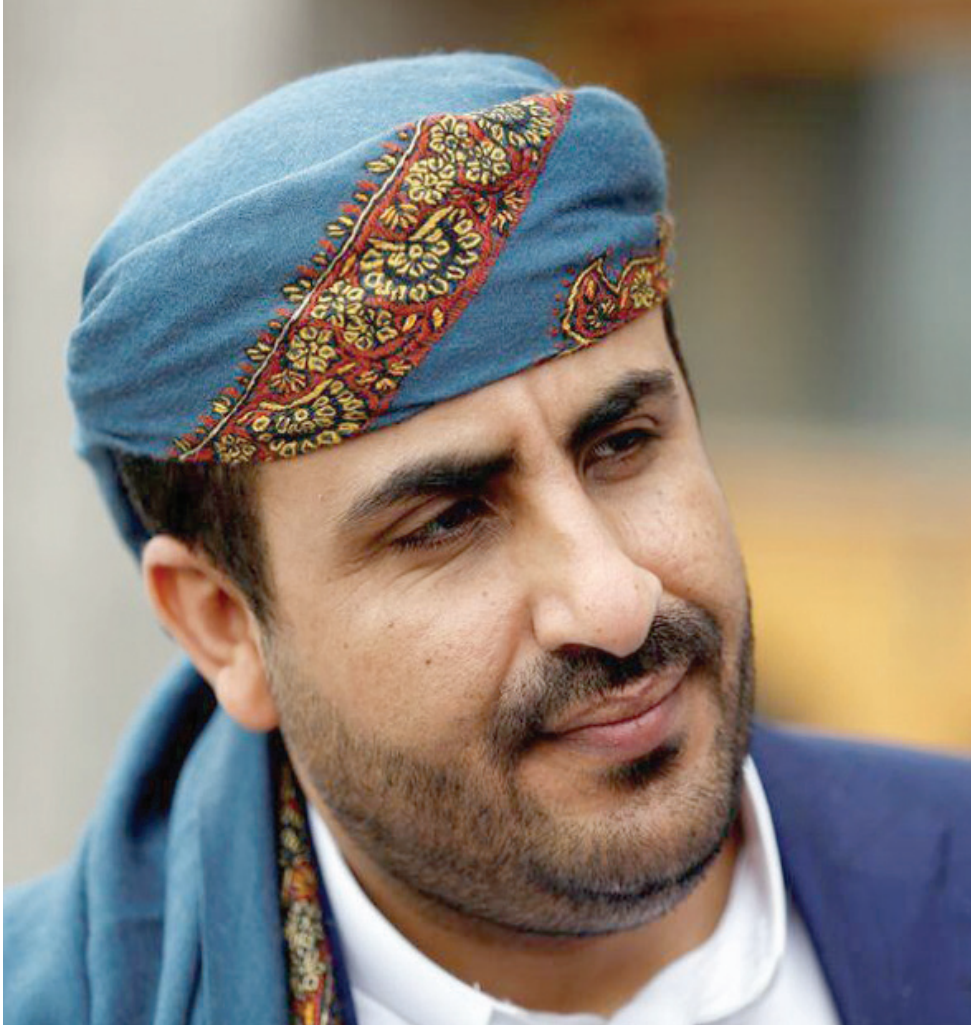
محمد عبد السلام كبير المفاوضين الحوثيين

لوقف هذه الهجمات بشكل كامل. وتضيف لـ«الشرق الأوسط» بالقول «حتى لو تضاعفت قدرتهم على استهداف السفن بدقة، فإن مجرد قيام الحوثيين بإطلاق صواريخ وطائرات من دون طيار على السفن سيشكل تهديداً للشحن البحري في البحر الأحمر في المستقبل المنظور». وتضيف الباحثة المتخصصة في اليمن، أن الحوثيين كان مطلبهم في البداية إنهاء الهجوم الإسرائيلي على غزة. «والآن يطالبون أيضاً بإنهاء الضربات الأميركية والبريطانية في اليمن، ويتعهدون بمواصلة استهداف السفن المرتبطة بإسرائيل والولايات المتحدة والمملكة المتحدة حتى تتم تلبية هذه المطالب. كلما زاد التصعيد الذي نراه، قلّ احتمال قيام الحوثيين بوقف هذه الهجمات. وعلى الرغم من أن المسؤولين الأميركيين والبريطانيين يقولون إنهم لا يريدون المزيد من التصعيد، فمن الصعب رؤية مخرج في هذه المرحلة». «عندما ينتهي الهجوم الإسرائيلي على غزة، أتوقع أن ينسحب الفضل إلى الحوثيين في ذلك» تضيف هانا «من غير المرجح أن تؤثر أعمال الحوثيين أو تستشكل عملية صنع القرار الإسرائيلية في غزة، لكن الحوثيين سيكثفون حريصين على القول إن هجماتهم على البحر الأحمر كانت السبب وراء توقف إسرائيل عن قصف غزة أو السماح بإيصال المساعدات الإنسانية». وبسؤاله «كيف يستتبع اليمنيون تجاوز أزمة البحر الأحمر والتركيز على خريطة الطريق الأممية للسلام، في الوقت الذي يلوح فيه الغرب بأن عمليات البحر (تهديد) لا تهدده». يقول الباحث بمعهد الشرق الأوسط للدراسات الاستراتيجية ومقره لاني: «لأن هناك من يخاف أن تتعرض هناك معلومات قد تكون غير صحيحة أو يحصل خطأ غير مقصود، وهذا يوضح دائماً للمجتمع الدولي».