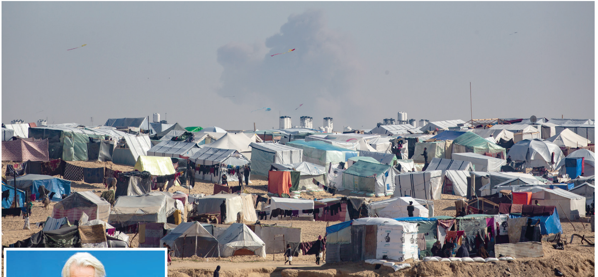
مخيم في رفح قرب الحدود مع مصر