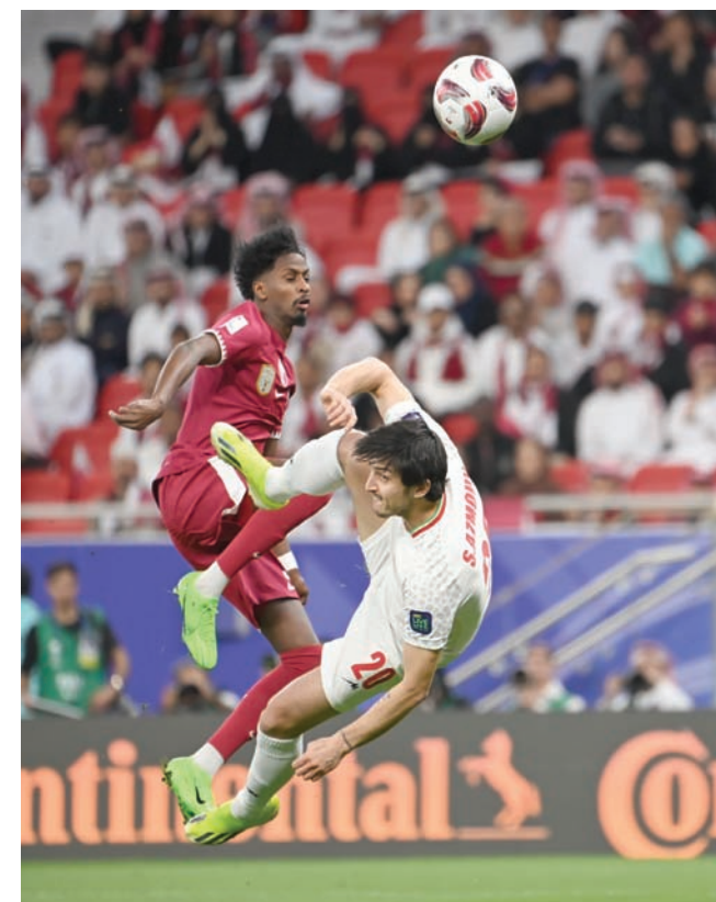
العنابي القطري قدم ملحمة كروية أمام إيران المتمنة

وأعشت خطة لوبيس الحيوية بين اللاعبين، مع لجوئه الدائم إلى التنوع في الخطط واللاعب. لم يعتمد على لاعب معين إلا وفق الظروف التي تناسبه، مثل الجوكو خوشي بوعلام، أحد نجوم البطولة السابقة الذي جلس احتياطياً لمعظم فترات البطولة قبل أن يشركه لوبيس في نصف الساعة الأخير من لقاء إيران، معززاً ترسانته الدفاعية أمام المد الإيراني. يرفض خوشي المغاربة بين نهائي 2019 الذي انتهى بفوز العنابي على اليابان، وبين النهائي الحالي أمام الأردن: «خسرنا أمام الأردن ودياً في قطر قبل البطولة، واعتقد أن المواجهة في لوسيل ستكون مختلفة». يقول لوكالة الصحافة الفرنسية: «الأردن منتخب كبير، وقدم كل شيء حتى يصل إلى النهائي، هذه المباراة مختلفة تماماً عن مواجهة اليابان في 2019، فهو نهائي عربي، ومن سيفوز سنبارك له».