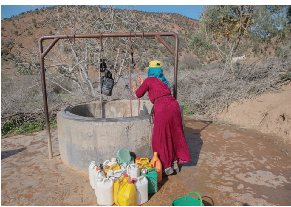
يشكك جل سكان قرى المغرب من شح المياه في الآبار التي تعودوا السقي منها

الهوية، فيما لايزال قتلى تحت أنقاض المباني بحسب «المركز السوري». وتوزع القتلى إلى 19 في الميادين، بينهم عناصر من «حزب الله»، و10 بمدينة دير الزور. وكانت الولايات المتحدة قد شنت عشرات الضربات الجوية، مطلع الأسبوع المنصرم، ضد جماعات متحالفة مع طهران في العراق وسوريا، مما أسفر عن مقتل نحو 40 شخصاً، تقول تقارير إن غالبيتهم من المسلحين. ودخلت جماعات متحالفة مع طهران على خط الصراع في المنطقة، مع اشتداد الحرب بين إسرائيل (حماس) في غزة.