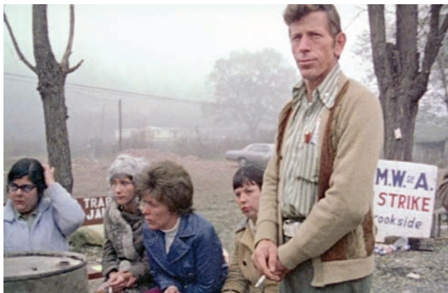
من «هارلان كاونتري، يو إس إيه» (كاين كريك)

لكن السائد هو أن من قابلتهم في الجهة المعارضة للإضراب لم يكن لديهم أي كلمات حسنة حيال ما تقوم به ووافقوا على الحديث للكاميرا لتأكيد وجهة نظرهم فقط. في النهاية وبعد أشهر طويلة من العمل عليه، فازت بفيلم فنياً بديع وسياسياً جارح وبعصرياً مخيف تبعاً لطريقة تصويره.