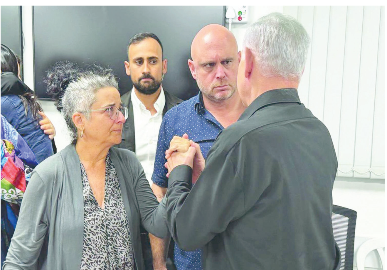
رئيس الوزراء الإسرائيلي بنيامين نتنياهو في مؤتمر صحفي يبتل أبيب بتاريخ الماضي

وأما عائلات الرهائن، التي كانت قد بنت كثيراً على بليتك أن ينجح في إقناع نتنياهو بالتقدم نحو صفقة، فقد أصيبوا بالإحباط وخيبة الأمل وتجدّد قلقهم على مصير الرهائن. ومع ذلك فقد أشارت وسائل إعلام إسرائيلية، الخميس، إلى أنه رغم أن نتنياهو وصف مقترح حركة «حماس» بشأن صفقة تبادل أسرى تشمل وقف إطلاق نار، بأنه «واهم» و«جنوني»، «ولا يسمح بالتقدم، فإنه لم «يغلق الباب»، ولم يقل بشكل واضح إن إسرائيل ترفض المقترح كليا وستتوقف المفاوضات حول تبادل