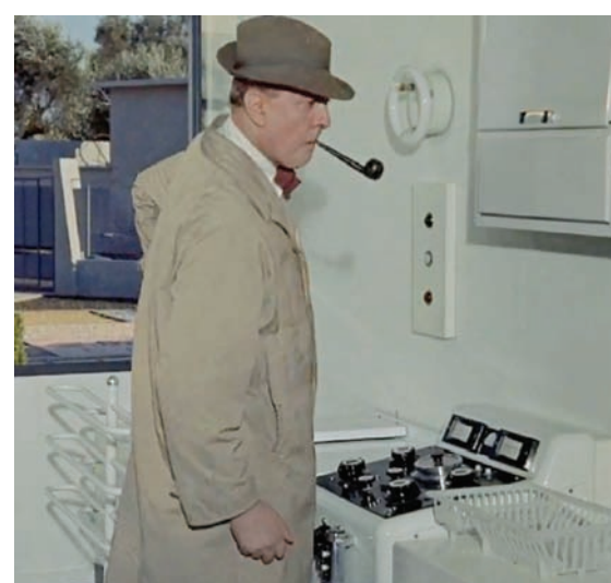
جاك تاتي (سيكنا فيلمز)

ربما أوحى للكوميدي البريطاني بيتر سلزجر بحركته المعتمدة في فيلم إدوارد مايك «The Party Game» سنة 1968، فهو رجل هندي يصل إلى حفلة لم يُدع إليها ولا معرفة له بتقنيات وأدوات البيت (حتى البسيطة) مما تنتج عنه مشكلات كبيرة لأن كل ما يللمسه