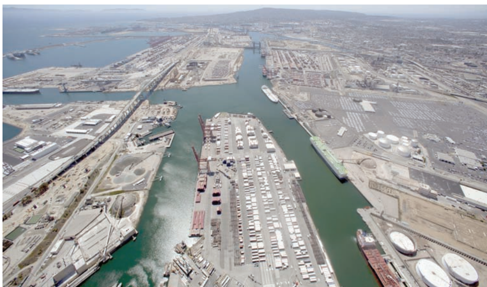
انتقد الجمهوريون في اللجنة هذه الخطوة قائلين إنها تقوض الفوائد الاقتصادية والبيئية للغاز الطبيعي وتضر بالولايات المتحدة (رويترز)

أما الرئيس والمدير التنفيذي لشركة «إي كيو تي كورب» توبي زي