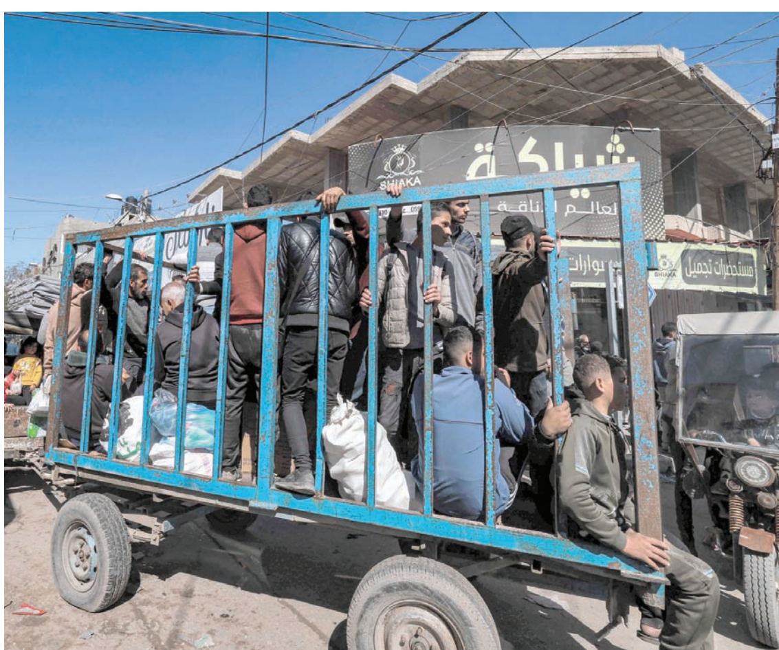
نازحون فلسطينيون يتنقلون عبر شوارع رفح