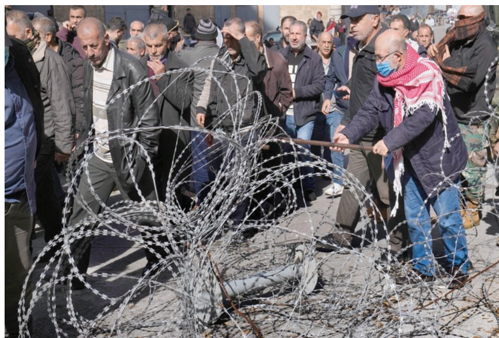
العسكريون المتقاعدون يحاولون إزالة الحواجز الشائكة في محيط السراي الحكومي

وهذا الأمر استدعى رد فعل من سليم الذي اعتبر أن الخطوة «مخالفة» لقانونية جديدة ارتكبتها رئيس الحكومة تصاف إلى سلسلة مخالفات وتجاوزات ترتكب منذ بدء الشغور الرئاسي، ولفت إلى أنه «سيبني على هذه المخالفة ما يقتضي حماية