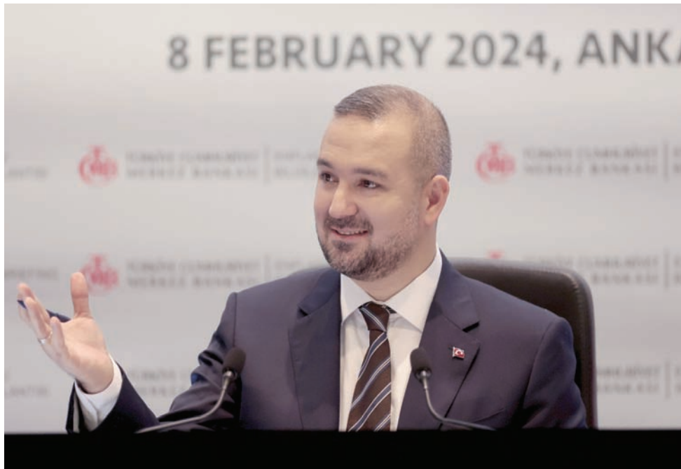
رئيس مصرف تركيا المركزي فاتح كاراتهان خلال إعلانه التقرير الفصلي الأول للتضخم (إ.ب.أ)

وكان التقرير الفصلي الأخير للعام الماضي توقع وصول التضخم