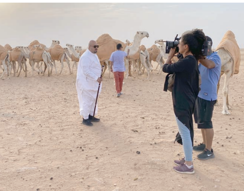
تصوير العمل استغرق نحو 50 يوماً ويعرض حالياً على «نتفليكس»

ويتزامن عرض المسلسل مع إعلان وزارة الثقافة السعودية عام 2024 «عام الإبل»، وهنا يؤكد عمر «أنهما محظوظان بذلك». خاصة أن «رحلة البحث عن الإبل» تعدّ خطوة جريئة نحو الجهول بالنسبة لهما بعد أن تركا وظيفتيهما في مجال الضيافة والاستثمارات الناشئة للإبحار بشجاعة في عالم الإبل، وما سيلحظه المشاهد خلال رحلة الثنائي المليئة بالمغامرة أن كل حلقة