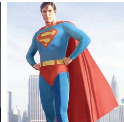
كريستوفر ريف «سوبرمان» (وورنر)