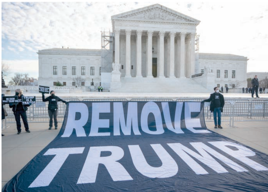
متظاهرون خارج المحكمة العليا يطالبون بمنع ترمب من خوض الانتخابات

التي تتعلق بالتعديل الرابع عشر قدمها ناخون أفراد، وسياسيون سابقون، ومرشّحون رئاسيون جمهوريون، ومنظمات راقية إلى المحاكم، ومجالس الانتخابات، خلال العام الماضي عبر 34 ولاية أميركية.