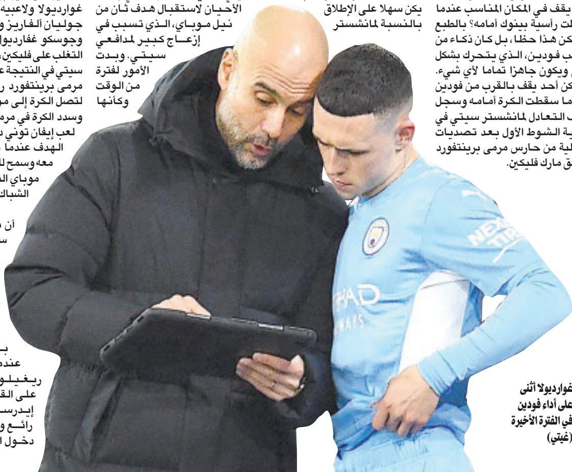
غوارديولا أثنى على أداء فودين في الفترة الأخيرة

لكن الشوط الأول لم يكن سهلاً على الإطلاق بالنسبة لمانشستر