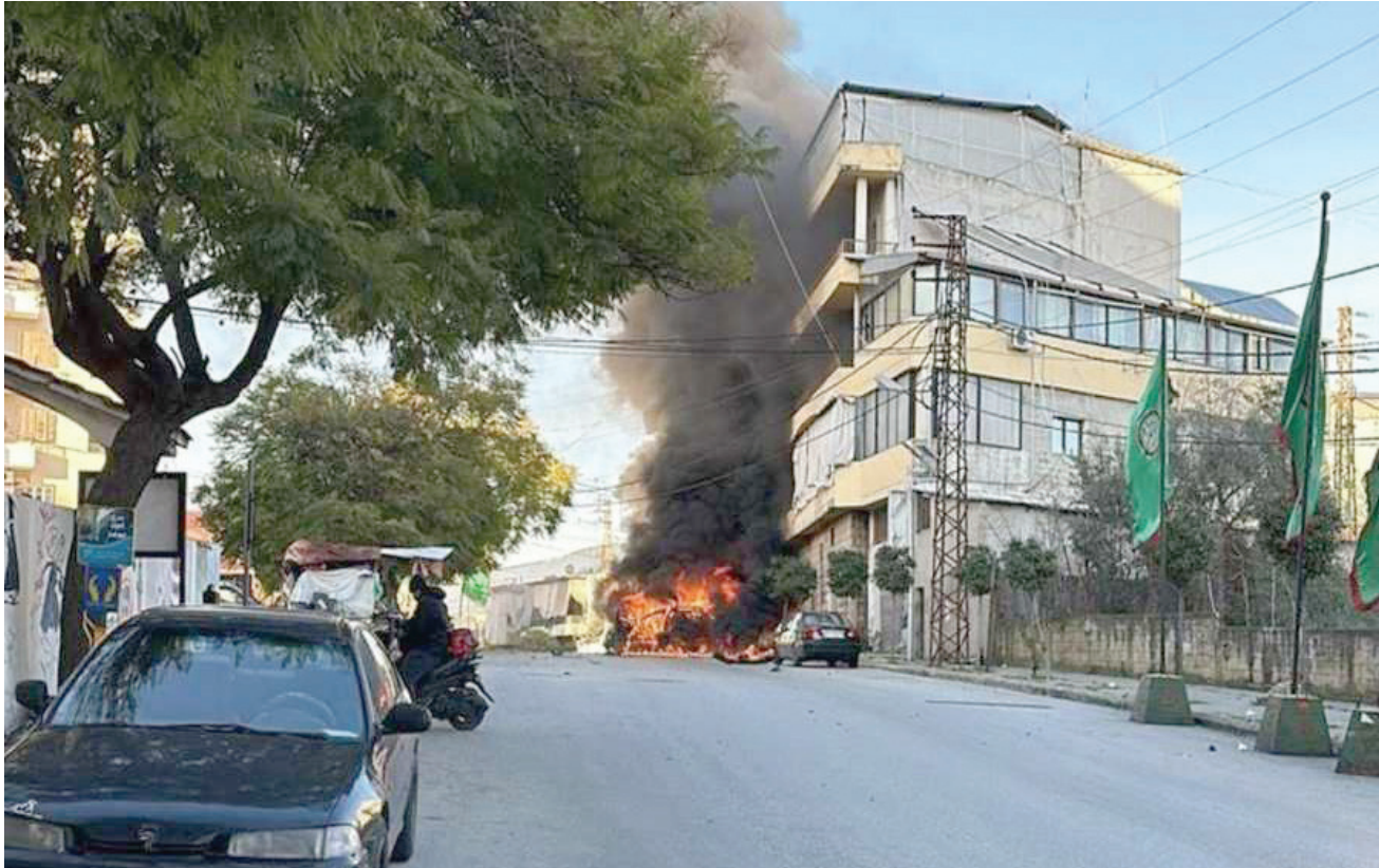
صورة متداولة للسيارة التي استهدفت في غارة إسرائيلية بمدينة النبطية

من جهته، أفادت «وكالة الصحافة الفرنسية»، نقلاً عن