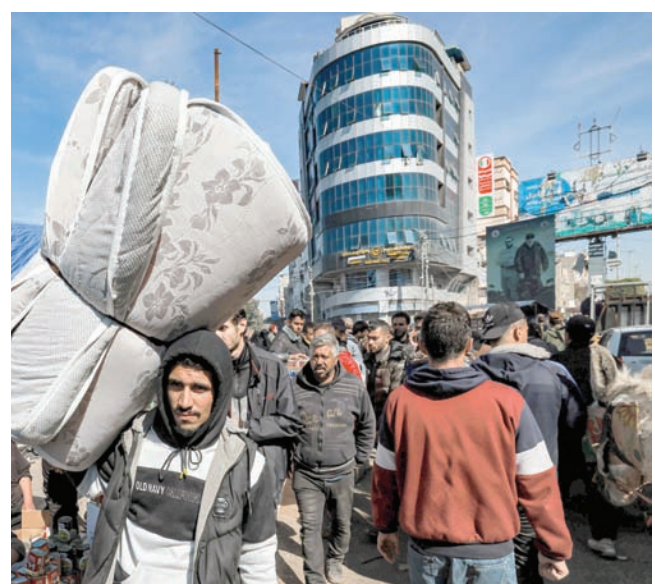
نازح فلسطيني يحمل أمتعته أمس في أحد شوارع مدينة رفح جنوب قطاع غزة

ووفقاً للبيانات التي أصدرتها الرياض منذ بدء الحرب الإسرائيلية على قطاع غزة، وموقفها الرسمي،