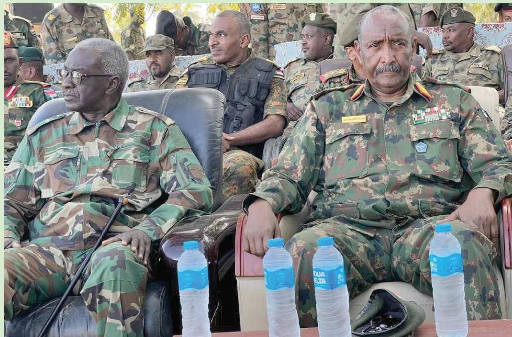
قائد الجيش السوداني عبد الفتاح البرهان خلال تفقده عدد من قواته مطلع يناير الماضي

وتأتي زيارة البرهان للمنطقة العسكرية التي يسيطر عليها الجيش، وتعد من أهم المناطق التي ينطلق منها الجيش في عملياته ضد «قوات الدعم السريع» بعد يوم واحد من تداول وكالات الأنباء والفضائيات لمعلومات عن محاولة انقلابية تنطلق من منطقة «كرري» العسكرية، واعتقل على إثرها ثلاثة ضباط برتب وسيطة. لكن الجيش نفى حدوث المحاولة الانقلابية، بيد أنه لم ينف «اعتقال الضباط»، وقل بعض مناصريه من العملية، وعذوا اعتقال الضباط نتيجة