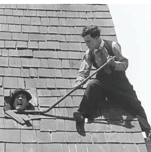
بستر كيتون في «أسبوع واحد» (تشكك بروكشتر)

إذا كان فيلم «أسبوع واحد» لبستر كيتون له تأثير ما في تاتي، فهو ليس الفيلم الوحيد. في الكوميديا هناك ثلاثة مناهج في الأداء: إشارة التعاطف صوب الشخصية (على غرار أفلام تشارلي تشابلن)، وإشارة النكتة الموجهة مباشرة إلى الجمهور (مثل لوي دو فونيس، وإسماعيل ياسين، من بين مئات)، وإدماج المشاهد في رصد شخصية لديها موقف من الحياة (بستر كيتون، وجاك تاتي). مع هذا، هناك حقيقة أن كل منهما لا يضحك بل يضحك، وهذا على عكس كل الكوميديين المعروفين. لكن بالطبع هناك فوارق أساسية من بينها أن كيتون واضح فيما يقوم به وليس غامضاً حين يأتي الأمر إلى علاقاته مع الآخرين، هو عاطفي أساساً، بينما تاتي لا يبدو من النوع الذي قد يقع في الحب مطلقاً. هو شخص وحيد حتى في محبته الفرنسية. يرتدي المعطف الواقي دوماً، يدخن غليونه ولا يكثر للقطات وجه قريبة لكي يقرأ المشاهد تعبيراً ما عليها.