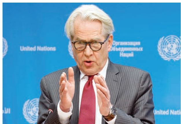
المنسق الخاص للأمم المتحدة لعملية السلام في الشرق الأوسط تور وينسلاند

التي استهدفتها يوم 7 أكتوبر (تشرين الأول). كما شدد على أهمية اتخاذ كافة الخطوات الممكنة لحماية المدنيين في غزة، بحسب بيان للمتحدث الرسمي باسم وزارة الخارجية ماثيو ميلر. وناقش الجانبان آخر الجهود الرامية إلى الإفراج عن بقية الرهائن وأهمية زيادة كمية المساعدات الإنسانية التي تصل إلى النازحين في مختلف أنحاء غزة. وتطرق بليكن إلى رؤية الولايات المتحدة للسلام والأمن المستدامين في المنطقة، كما أعاد التأكيد على دعم بلاده لإقامة دولة فلسطينية، خلال اجتماع مع رئيس الوزراء الإسرائيلي بنيامين نتانياهو في إسرائيل. وجدد بليكن التأكيد على دعم الولايات المتحدة لـ«حق إسرائيل في ضمان عدم تكرار الهجمات الإرهابية».