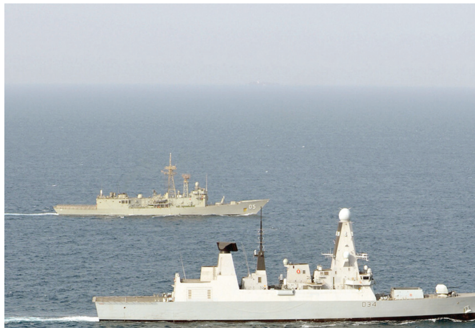
تسبب التوترات في البحر الأحمر في مفاكمة المأساة الإنسانية في اليمن وتدهور مستوى الأمن الغذائي (أ.ف.ب)

وزنه 50 كيلوغراماً 15 ألف ريال يمني، رغم تحديد سعره بـ12,700، ووصل سعر كيس الدقيق بالوزن نفسه إلى 16 ألف ريال رغم تحديد سعره بـ13,700 ريال؛ حيث يبلغ سعر الدولار في محافظتنا سيطرة الجماعة الحوثية 530 ريالاً.