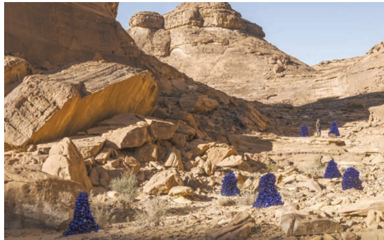
من أعمال قادر عطية (الهيئة الملكية للعُلا)