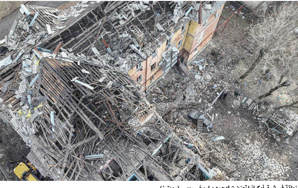
كييف - موسكو: «الشرق الأوسط»

اكتشفت قوات كييف البرية بان الوضع متوتر في شرق البلاد، إذ هاجمت أعداد كبيرة من القوات الروسية، الخميس، بلدة أفدييفكا المحاصرة منذ أشهر عدة في شرق أوكرانيا من جميع الاتجاهات، في حين أعلن رئيس بلديتها أن الوضع يزداد صعوبة بالنسبة للقوات الأوكرانية التي تدافع عنها.