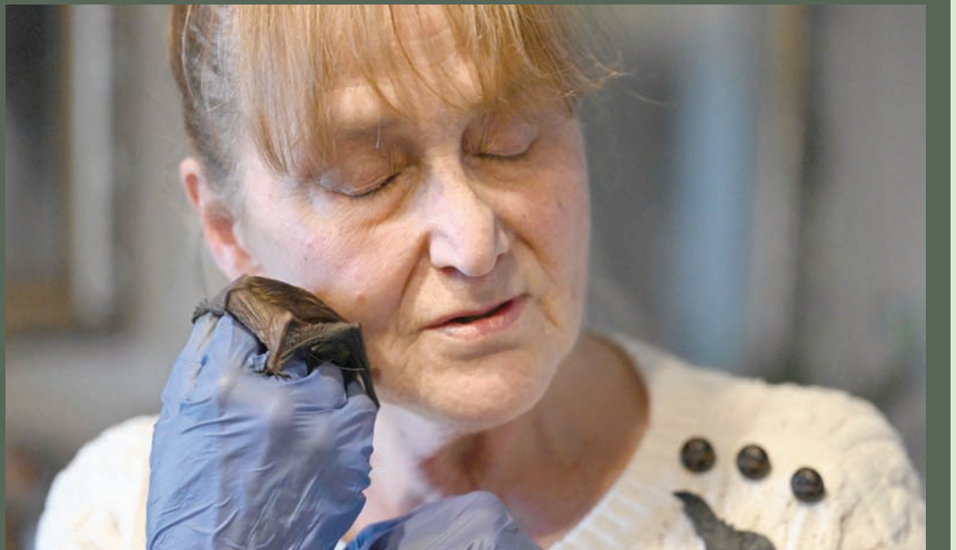
«الأم الطوطا»

وإنّ تؤكد صاحبة الشقة البالغة مساحتها نحو 60 متراً مربعاً، والواقعة في شتين