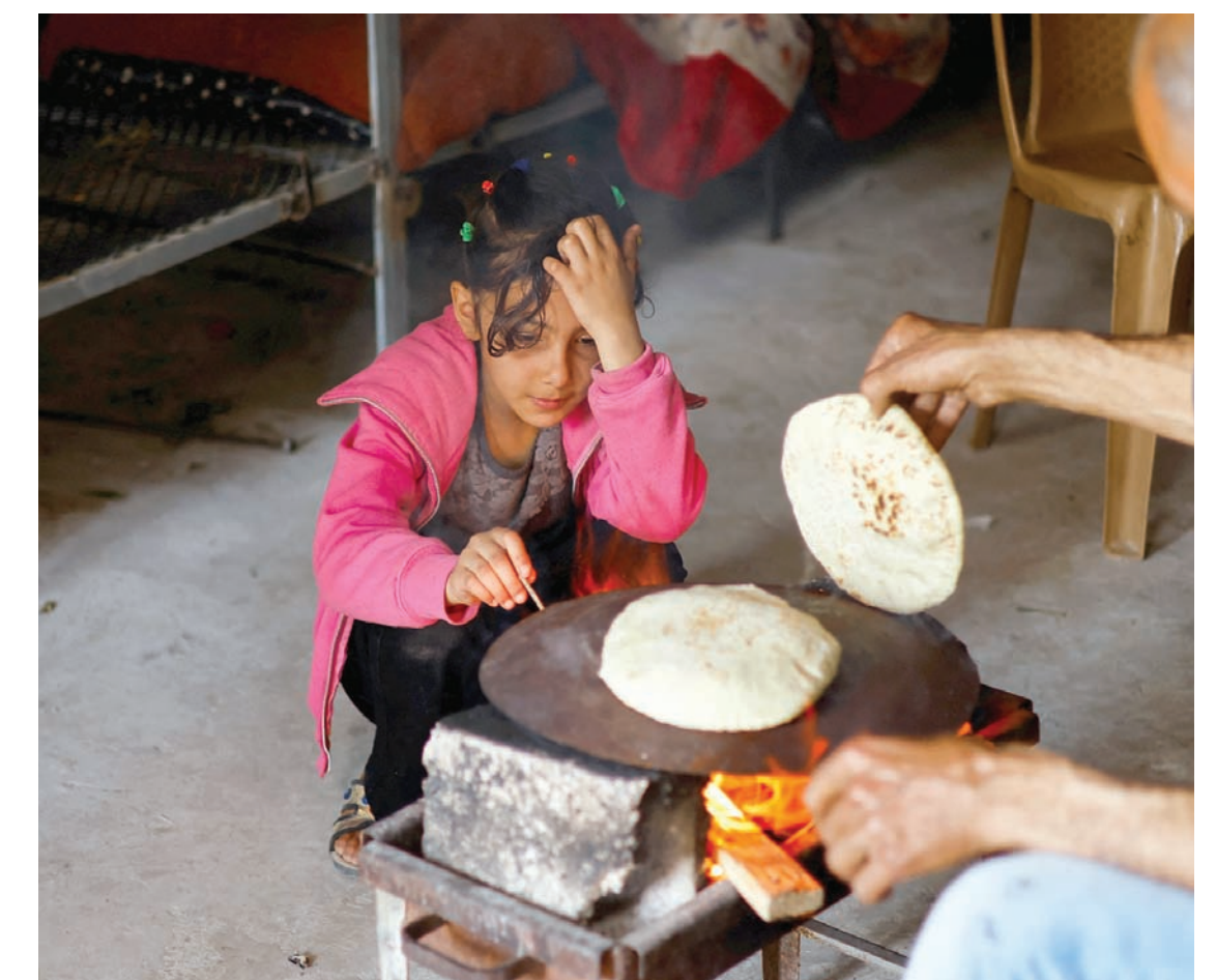
طفلة فلسطينية في رفح (جنوب) قطاع غزة تجلس (الأربعاء) إلى جوار جدتها بانتظار أرغفة الخبز