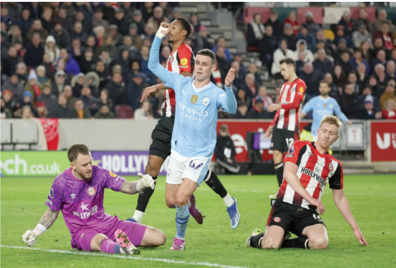
فودين وفرحة هدفه الثالث في شباك برينتفورد

تألق فيل فودين بشكل لافت للانتظار في المباراة التي فاز فيها مانشستر سيتي على برينتفورد بثلاثة أهداف مقابل هدف وحيد، وكان أبرز ما يميز هذا النجم الشاب هو التفكير بشكل أسرع من خصومه، ومراوغة مراقبيه بتحركاته الذكية، واستغلال الفرص ببراعة في كل مرة يكون فيها أمام المرمى. لم يتمكن لاعبو برينتفورد من التعامل مع مهارة فودين، وعلى الرغم من أن بعض المهاجمين يستسلمون ويقفون دون حركة ويسهلون الأمور على المدافعين، فإن فودين لا يتوقف أبداً. إنه لا يفعل أي شيء من أجل الاستعراض، ولا يقوم بأي شيء تافه أو يفعل أي شيء من دون هدف يسعى لتحقيقه. في الحقيقة، يتعين على المهاجمين الشباب الآخرين أن يشاهدوا ما يقدمه هذا اللاعب من كتب حتى يتعلموا منه، خاصة أنه لا يتوقف عن الحركة، ودائماً ما يبحث عن المساحات الخالية، وهو الأمر الذي خلق متاعب هائلة للاعبين برينتفورد، وعندما أخطأ مدافع برينتفورد، إيثان بينوك، في إبعاد الكرة عرضية التي لعبها كيفن دي بروين قبل نهاية الشوط الأول، وصلت الكرة إلى فودين الذي كان في حالة تاهب قصوى ولم يتوان في وضع الكرة داخل الشباك محرراً هدف التعادل لمانشستر سيتي. لكن هل كان فودين مخطوفاً لأنه كان يقف في المكان المناسب عندما سقطت رأسية بينوك أمامه؟ بالطبع لم يكن هذا حظاً، بل كان ذكاء من جانب فودين، الذي يتحرك بشكل رائع ويكون جاهزاً تماماً لأي شيء. لم يكن أحد يقف بالقرب من فودين عندما سقطت الكرة أمامه وسجل هدف التعادل لمانشستر سيتي في نهاية الشوط الأول بعد تصديقات بطولية من حارس مرمى برينتفورد المتألق مارك فليكين.