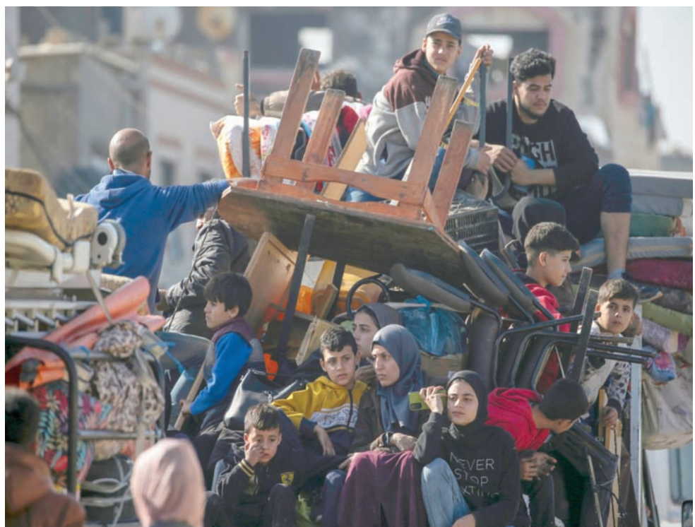
إخلاء سكان مخيمي «التصيرات» و«البريج» للاجئين خلال العمليات العسكرية الإسرائيلية في قطاع غزة