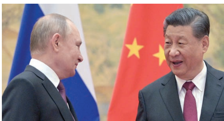
الرئيسان الصيني شي جينبينغ والرئيس فلاديمير بوتين

دون تسمية واشنطن بشكل صريح. وتندد الصين وروسيا بانتظام بالتدخلات التي تقولان إنها تعرضان لها من قبل الدول الغربية، وفي مقدمها الولايات المتحدة، وذلك في ما يتعلق بتايوان بالنسبة إلى بكين والغزو الروسي لأوكرانيا بالنسبة إلى موسكو.