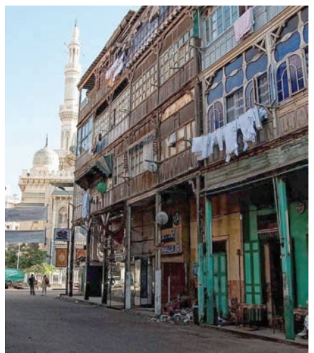
طران معماري مميز