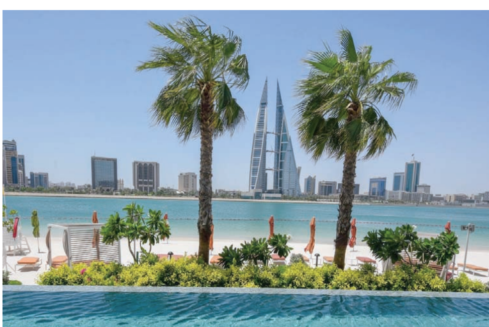
يمثل القطاع السياحي الأكثر نمواً وجذباً لحركة التبادل بين السعودية والبحرين (الشرق الأوسط)