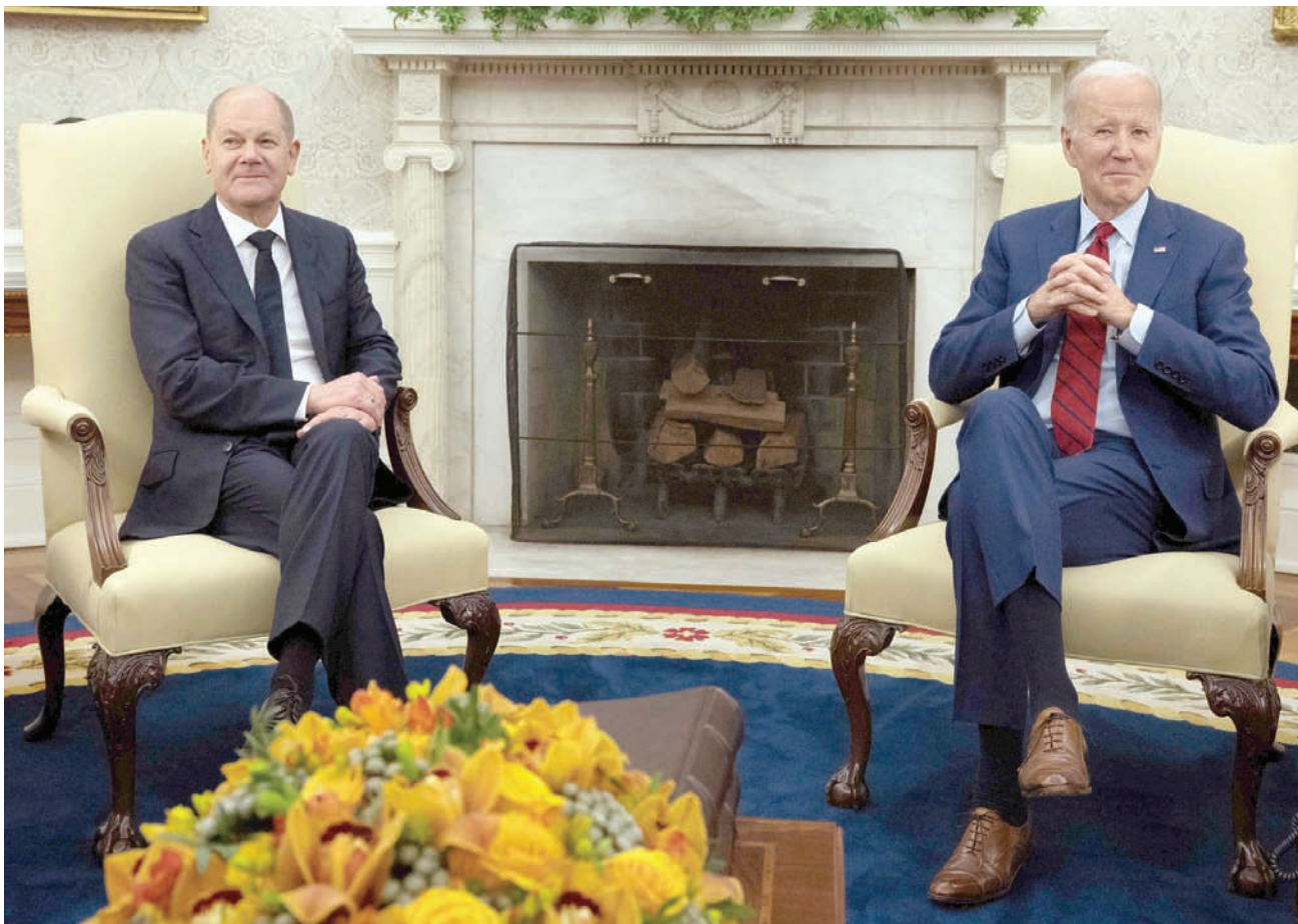
صورة أرشيفية لقاء بين الرئيس الأميركي جو بايدن والمستشار الألماني أولاف شولتس في البيت الأبيض في مارس العام الماضي

لا تقدم مساهمات كافية، وقد حرص شولتس على الإشارة لحجم المساعدات الألمانية أمام ضيفه رئيس الوزراء الفرنسي الجديد غابرييل أتال الذي زار برلين قبل يومين في زيارة تعارف هي الأولى له منذ تسلمه منصبه. وقدمت فرنسا التزامات عسكرية لأوكرانيا بقيمة تقارب 500 مليون يورو، ما يضعها في المرتبة الـ15 من بين الدول الغربية التي تقدم مساعدات لكيف، بحسب معهد كيبيل، فيما ألمانيا في المرتبة الثانية بمساعدات مضاعفة بمرات عديدة.