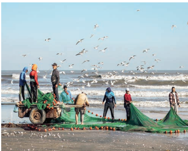
شاطئ بورسعيد (الموقع الرسمي للمحافظة)

خلال السنوات القليلة الماضية إلى وجهة لمحبي هذا النشاط؛ حيث يمكن للسائح الاستمتاع بمنظر الطيور المختلفة وهي تزين المدينة، لا سيما في شواطئها الممتدة، وكانها تشارك سكانها الترحيب بالزائرين، ومن أشهرها الغلامغو، والجبع والطيور الخواصات، والبشونات، والزرزور، والفرسان، والنوارس، والقائلق وغيرها. لذلك دشنت المدينة مهرجاناً سنوياً دولياً لذلك، يقول محمد أبو الذهب، نائب مدير مكتب هيئة تنشيط