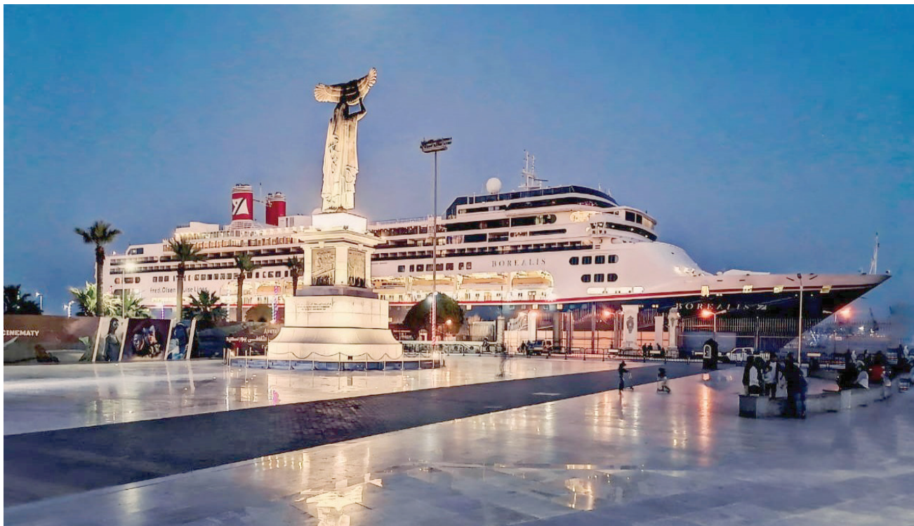
بورسعيد مدينة تبيض بالحياة

السياحة ببورسعيد لـ «الشرق الأوسط»: «أصبحت مراقبة الطيور واحداً من أهم أنواع السياحة في العالم، ولذلك اتجهت المدينة إلى استهداف هذا النمط السياحي؛ ذلك أنها تتمتع بـ3 محطات رئيسية لاستقبال الطيور المهاجرة، وهي بحيرة المنزلة، ومحمية أشنوم الجميل، إضافة إلى بحيرة الملاحات شرق بورسعيد».