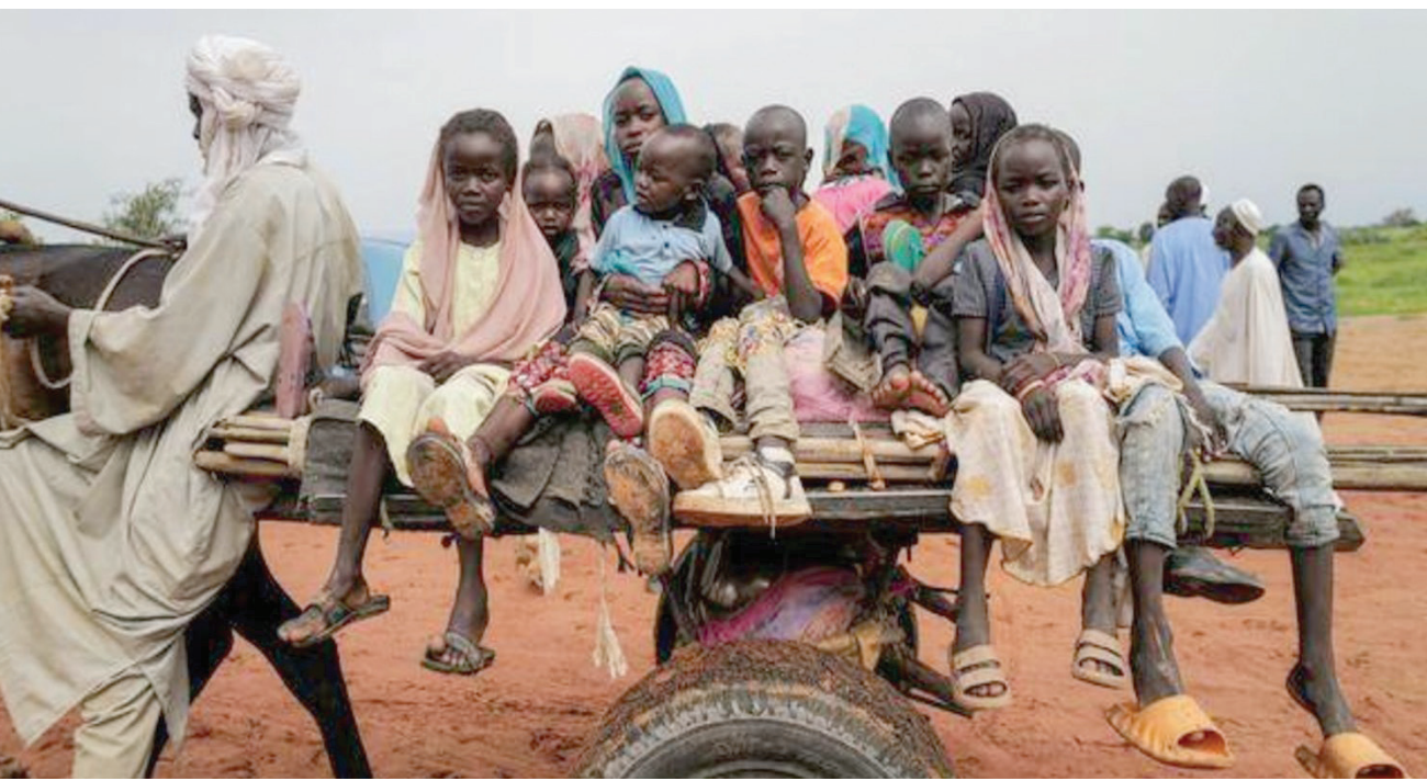
أطفال سودانيون فروا من الصراع في دارفور بالسودان

وكانت شركتا «MTN، وسوداني» قد أعلنتا في بيانين مقتضبين أن خدمتهما توقفتا لـ«ظروف خارجة عن إرادتهما»، وأنها تسعى لإعادة الخدمة في أقرب وقت، لكن خدمة الشركتين لم تعد للمستهلكين منذ السبت الماضي، فيما قالت شركة زين السودان، إنها تعمل على المحافظة على خدمة الاتصالات والإنترنت، لتقليل من آثار توقفها «الكارثية» على المواطنين، وقالت إن فرقها الفنية ومنسوبيها يعملون في «ظروف صعبة وقاسية وخطيرة للغاية»، وإن قطع الخدمة الحالي «يأتي لظروف خارج إرادتها».