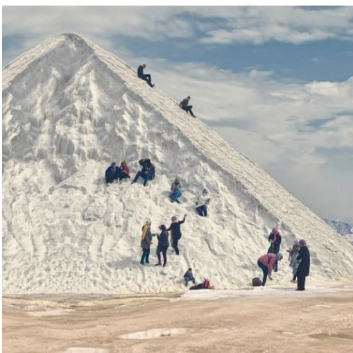
جبال الملح ببورسعيد