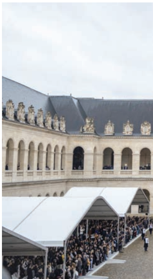
صورة لساحة الداخلية لقصر الأنفاليد في باريس حيث جرى تكريم ضحايا هجوم 7 أكتوبر من الفرنسيين اليهود أمس

باريس: ميشال أبو نجم كانت ساحة قصر الأنفاليد هو المبنى الذي يعود تاريخ بنائه إلى القرن السابع عشر، زمن حكم الملك لويس الرابع عشر، الذي أطلق عليه لقب «الملك الشمس»، تخص بكن مسؤولي الدولة الفرنسية من وزراء ونواب، حاليين وسابقين، وسلطات روحية وديبلوماسية وعشرات من المواطنين الذين التأموا في هذا المكان التاريخي، بمناسبة مراسم تبجيل الضحايا اليهود الفرنسيين الـ42 الذين قتلوا في العملية العسكرية التي قامت بها «حماس» وتنظيماً أخرى في غلاف غزة صباح 7 أكتوبر (تشرين الأول) الماضي. كان من بين الحضور أربعة من نواب حزب «فرنسا اليمين» اليساري المتشدد رغم رفض عائلات الضحايا وجودهم في الاحتفال بالنظر للمواقف السياسية الداعمة للفلسطينيين التي ينتهجها الحزب المذكور الذي يشكل عام يعجز خارج سرب الداعمين بلا تحفظ لما تقوم به إسرائيل في غزة. وتحت شعار «مراسم تبجيل ضحايا الهجمات الإرهابية في إسرائيل»، نظمت الرئاسة الفرنسية احتفالاً تخللته مقطوعات موسيقية؛ منها مقطوعة رافيل المسماة «كاديش» وأخرى لشوبان «المسيرة الجنائزية»، إضافة إلى النشيد الوطني الفرنسي، وذلك بالتزامن مع دخول حاملي صور الضحايا من عناصر الحرس الجمهوري. وكانت باريس قد استقدمت من إسرائيل عائلات الضحايا بطائرة خاصة. وجرى الاحتفال وسط تدابير أمنية استثنائية وقطع الطرق المفضية إلى قصر الأنفاليد وحوله. وفي كلمة القاها، نذّر الرئيس إيمانويل ماكرون بما سماها «أكبر مذبحه معادية للسامية في قرنا»، مشيراً إلى أن «لا شيء يمكن أن يبرر هذا الإرهاب أو يغفر له»، واصفاً إياه