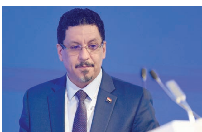
صعوبات اقتصادية تضاعف من التحديات التي يواجهها رئيس الحكومة اليمنية الجديد (أ.ف.ب)

كما طالب المجتمعون الحكومة بالسعي للحصول على المساعدات من الجهات المانحة والتحالف لوضع الدفعة التامينية (50 مليون دولار) بأسعار العملات والمضاربة في السوق أدباً لانفلات وانهايار العملة. وتناقش عملية عن «البنك المركزي» وقال إنه لا يستطيع أن يقوم بمسؤوليته إلا إذا توافرت لديه موارد كبيرة من العملات الأجنبية تمكّنه من التدخل في السوق وتحديد أسعار الصرف، وطالب بتقليص الإنفاق الحكومي، وتحصيل الإيرادات العامة للدولة بشكل منظم، وتوريدها إلى حساب «البنك المركزي» بالعملة المحلية والعملات الأجنبية.