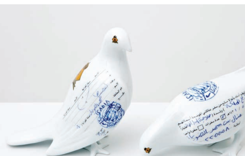
من عمل «معلقون سويًا» (من مقتنيات متحف)