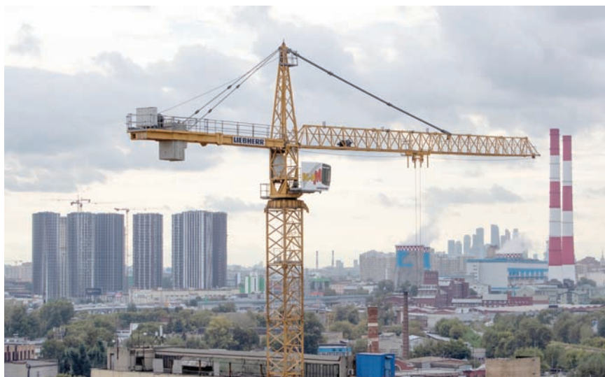
ارتفعت إيرادات الموازنة الفيدرالية الروسية غير النفطية والغاز بنسبة 84,8% خلال يناير على أساس سنوي

كما أشارت الوزارة إلى ارتفاع إيرادات الموازنة الفيدرالية الروسية غير النفطية والغاز بنسبة 84,8 في المائة، خلال يناير، على أساس سنوي إلى 1,721 تريليون روبل (18,9 مليار دولار)، ووفقاً للأرقام الأولية التي أصدرتها وزارة المالية، بلغ عجز الموازنة الفيدرالية،