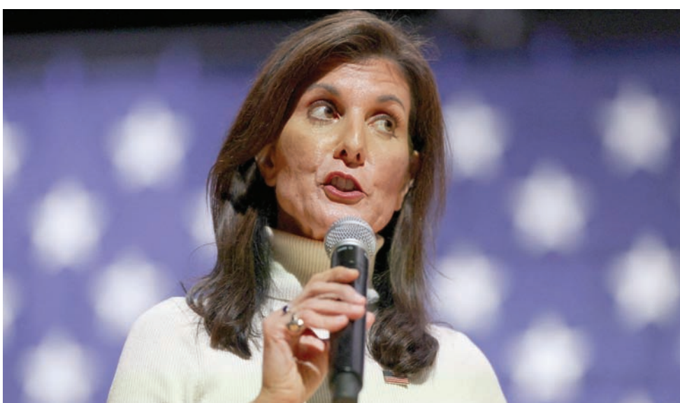
المرشحة الجمهورية للانتخابات الرئاسية الأميركية نيكي هايلي

وكان المرعون في نيفادا أضافوا عبارة «لا أحد من هؤلاء المرشحين» خياراً في كل السباقات على مستوى الولاية، بمثابة وسيلة للناخبين بعد فضيحة «ووترغيت» للتعبير عن عدم الرضا عن اختياراتهم. ولا يمكن له «لا أحد» أن يفوز بمنصب منتخب، لكن هذا الخيار جاء في المركز الأول في الانتخابات التمهيدية للكونغرس في عامي 1976 و1978. كما أنهى السباق متقدماً على كل من جورج بوش وإدوارد كينيدي في الانتخابات التمهيدية الرئاسية في نيفادا عام 1980. والمؤتمرات الحزبية يوم الخميس هي المنافسة الوحيدة في ولاية نيفادا التي يتم احتسابها ضمن ترشيح الحزب الجمهوري للرئاسة. لكن كان يُنظر إليها