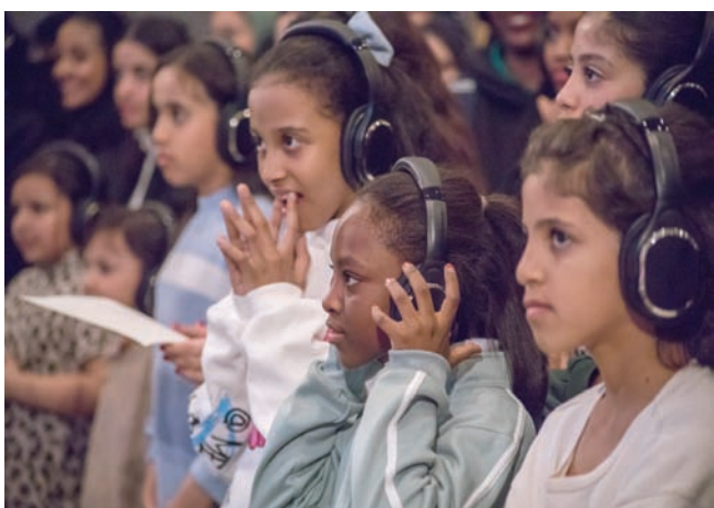
مشاركات في الورشة