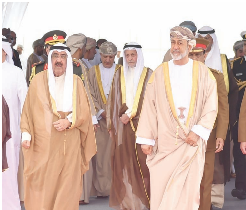
يُعد مشروع مصفاة الدمق والصناعات البتروكيميائية أكبر مشروع استثماري مشترك بين سلطنة عُمان ودولة الكويت برأس مال تجاوز 9 مليارات دولار

والقى عبد السلام بن محمد المرشدي رئيس جهاز الاستثمار العماني كلمة أكد فيها على أن افتتاح هذا المشروع المشترك بين سلطنة عُمان ودولة الكويت «يأتي تجسيدا للعلاقات المتجددة بين البلدين منذ القدم وتحتوي لهذا