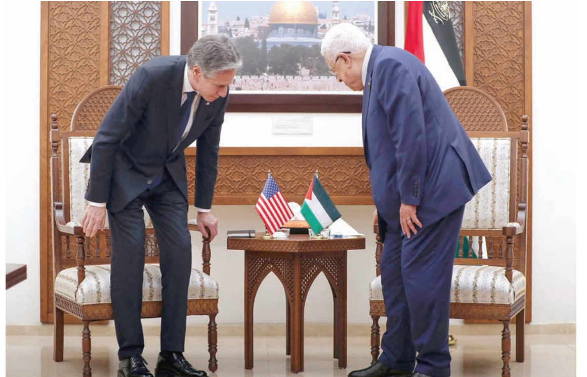
الرئيس عباس خلال استقبال بليكن في رام الله أمس