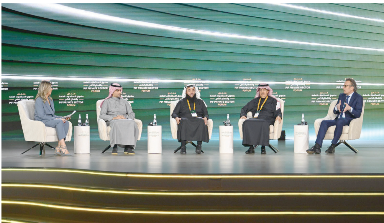
إحدى جلسات الحوارية لليوم الثاني من «منتدى صندوق الاستثمارات العامة والقطاع الخاص»...

وأكد المشاركون في الجلسات المصاحبة لأعمال منتدى صندوق الاستثمارات العامة والقطاع الخاص، أن الحكومة السعودية استطاعت