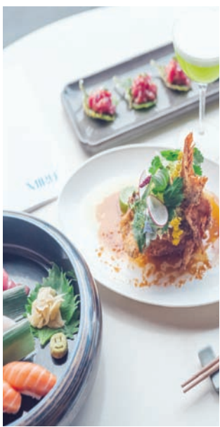
مدينة الطعام الجيد (نيويورك تايمز)

لا أحد يحتاج إلى إخبار أهل شيكاغو بأن المدينة لديها بعض أفضل الأطعمة المكسيكية عن أي مكان آخر (شيكاغو لديها عدد من المهاجرين المولودين في المكسيك أكثر من أي منطقة أخرى في الولايات المتحدة باستثناء لوس أنجليس). اعثر على تجربة لذيذة مع وجبة الفطور في مطعم «كاي غول لاني» وهو مطعم للماكولات المكسيكية الأصلية بلا رتوش في منطقة أب- تاون، على الجانب الشمالي (جرب هناك طبق «هويغوس الأوكسكوبينا» المكسيكي الشهير). ومن هناك، توجه شمالاً عبر حي أندرسونفيل السويدي التاريخي،