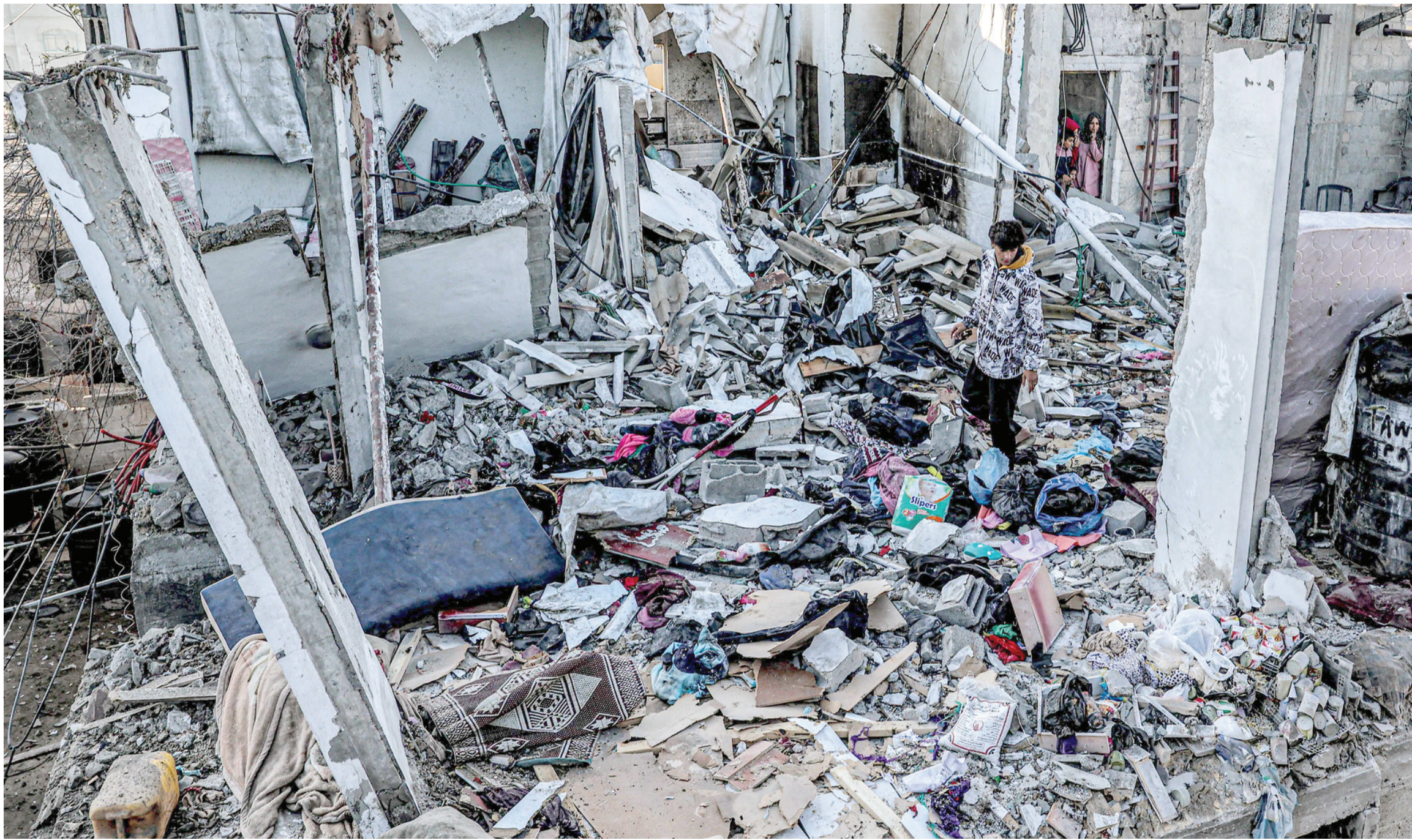
قتى فلسطيني بين أطلال منزل دمرته غارة إسرائيلية في رفح