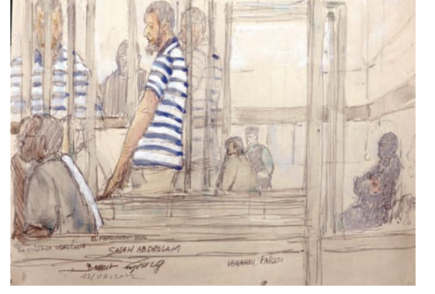
رسم يخط اليد لعبد السلام داخل المحكمة في بلجيكا