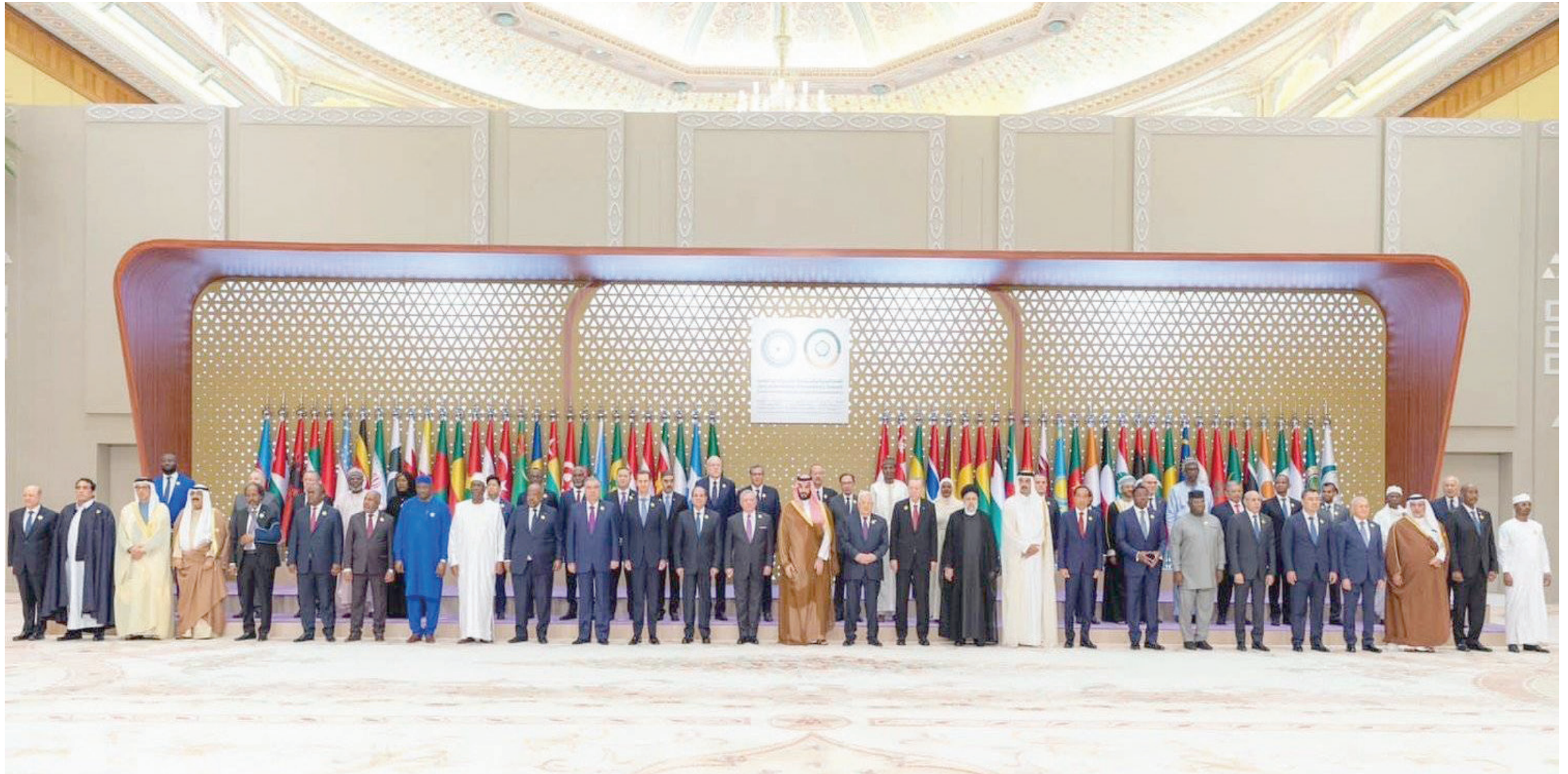
استضافت السعودية «القمة العربية الإسلامية المشتركة غير العادية»، بحضور شبه كامل للزعماء العرب والمسلمين في نوفمبر (تشرين الثاني) الماضي بالرياض