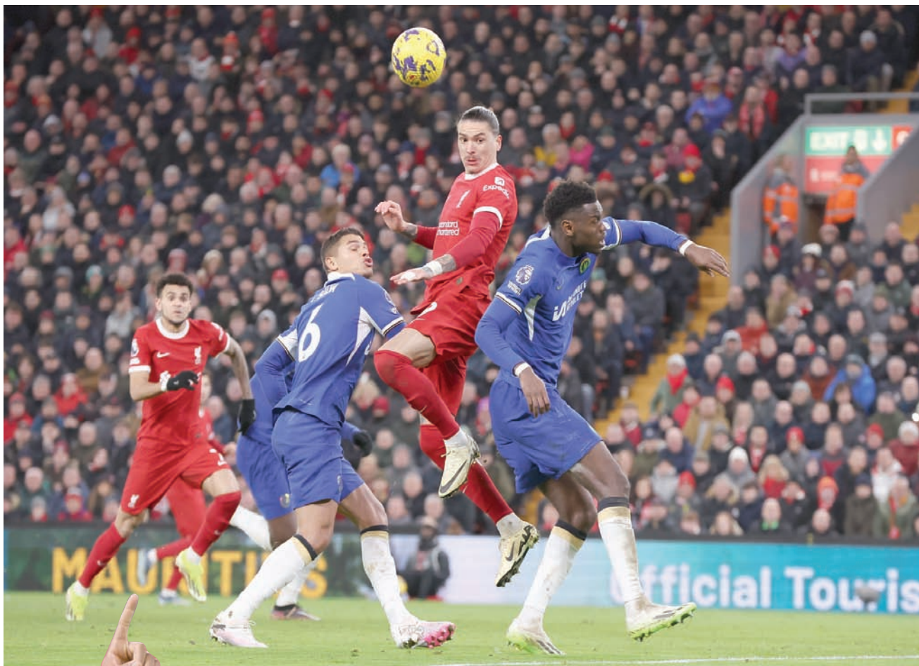
يعود تدني الحصيلة التهديفية لنونيز إلى تسديد الكرات في القائمين والعارضة

لكن الأمر نفسه ينطبق أيضاً على مهاجم ليفربول، داروين نونيز، الذي لم يسجل سوى سبعة أهداف في الدوري هذا الموسم، لكنه يتأخر بـ 24 مركزاً عن جيسوس في