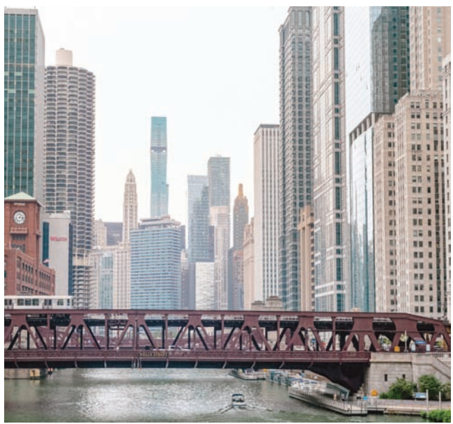
مدينة تجذب أهل البلاد والسياح من كل أصقاع العالم (نيويورك تايمز)

في منطقة «ماجنيست مايل»، وهي الطريق الرئيسية للتسوق في وسط مدينة شيكاغو، ومكان معتبر لتناول وجبة خفيفة في الهواء الطلق. استمتع بسُلطة النيسوار قبل التسوق في متجر «سيسيس 519»، الذي يُقدم الملابس، وحقائب اليد، والأعمال الفنية غير التقليدية، والعطور. امش في الخارج لتشاهد الجواهر المعمارية من حولك: على طول «ليك شور درايف»، أو بُرجي «ميس فان دير روه» على إسهامات المهندس المعماري الحديثة في المدينة، أو منازل «جيلد إيج» النادرة