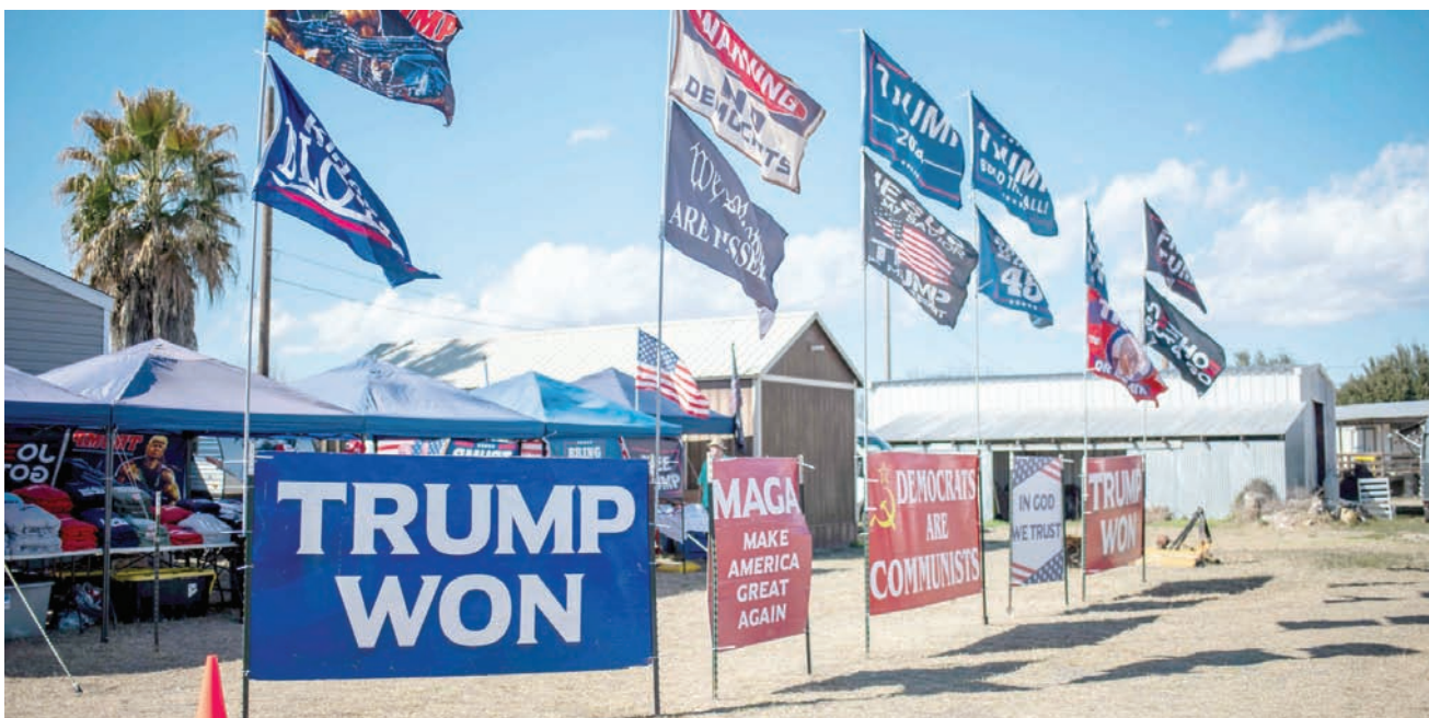
مظاهرات داعمة لترتيب ومعارضة للهجرة على الحدود مع المكسيك في 3 فبراير 2023

لم يكن جونسون يعلم قبل طرح العزل للتصويت في المجلس أنه