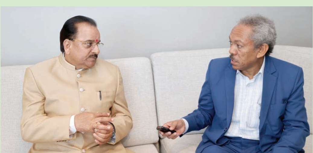
أجاي بهات وزير الدولة الهندي للدفاع متحدتاً إلى «الشرق الأوسط» في الرياض

وأضاف: «تتوقف الترتيبات بالوقوف للطائرات المقاتلة التابعة للقوات الجوية الهندية. إن تدريب 55 من طلاب البحرية الملكية السعودية في كوتشي وزيارة 11 وفداً من الخبراء المتخصصين من كلا الجانبين في عام 2023 يتهدد في حد ذاته على العلاقات المتنامية».