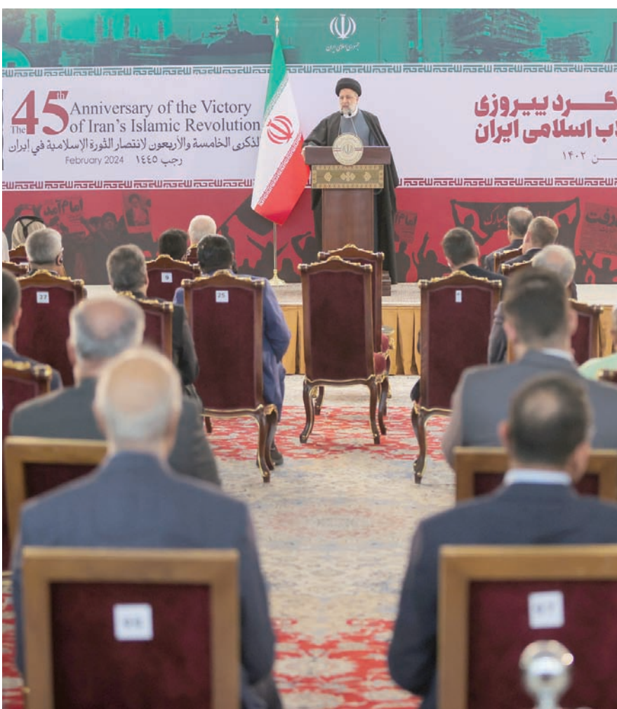
رئيسي يلقى كلمة أمام سفراء ودبلوماسيين معتمدين في طهران

كما انتقد رئيسي مواقف القوى الكبرى من البرنامج النووي الإيراني. وقال إن معارضة تقدم الشعب الإيراني هو السبب الأساسي لمعارضة الغرب للأنشطة السلمية الإيرانية». وأضاف «علنا مرراً أنه لا مكان للأسلحة النووية في عقيدة الجمهورية