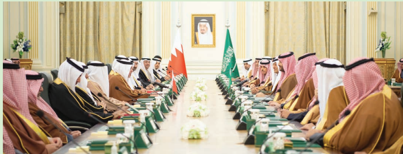
جانب من الاجتماع الثالث لمجلس التنسيق السعودي، البحريني في الرياض

البلدين الشقيقين، ومنها المبادرات التي تعمل عليها لجان مجلس التنسيق السعودي، البحريني، والتي تهدف إلى وضع التطلعات والرؤى المشتركة موضع التنفيذ وجاء انعقاد الاجتماع الثالث لمجلس التنسيق السعودي البحريني في إطار الروابط الأخوية والتاريخية الراسخة والمختينة التي تجمع البلدين وشعبهما الشقيقين، وتعزيزاً للعلاقات الثنائية بينهما، وبحضور عدد من الأمراء والوزراء رؤساء اللجان الفرعية المختصة عن المجلس من الجانبين.