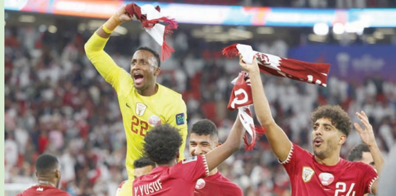
تغلب منتخب «العنايي» القطري «المضيف» على إيران أمس بنتيجة 2-3 في مواجهة دور الأربعة من بطولة كأس آسيا، ليحقق بد «نشامى» الأردن إلى النهائي الكبير السبت المقبل على ملعب لوسيل المونديالي، في ثالث نهائي عربي خالص بعد مواجهة السعودية والإمارات في نهائي نسخة، 1996 والعراق مع السعودية في نهائي نسخة 2007. وفي الصورة لاعبو قطر يحتفلون بالفوز في المباراة (تفاصيل ص 17)

«عنايي» قطر يلحق بد «نشامى» الأردن إلى نهائي آسيا