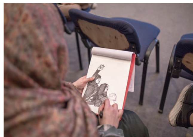
شاركت الحاضرات برسومات تعبر عن المرأة السعودية

عن إحساسها بحضور ورشات العمل المختلفة، «أحس أنني قوية وفخورة بالمنجزات التي حققتها المرأة السعودية».