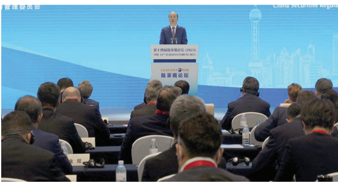
تأتي إقالة بي في الوقت الذي أصبحت فيه الأسواق الصينية على حافة الهاوية حيث يتدافع المستثمرون الكبار والصغار لتقليص خسائرهم

ولفت إلى أن هذا المشروع الذي وضع حجر أساسه السلطان هيثم بن طارق في عام 2018، يقع في المنطقة الاقتصادية الخاصة بالدمق «التي لا يخفى على أحد مدى أهميتها الاستراتيجية، لما تتميز به من موقع متفرد، وما تمتلكه من