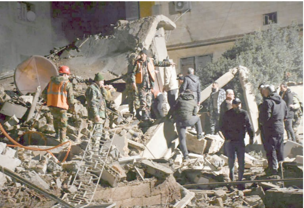
قوات الأمن السورية قرب اقتناص مبنى دمرته غارات إسرائيلية وسط مدينة حمص