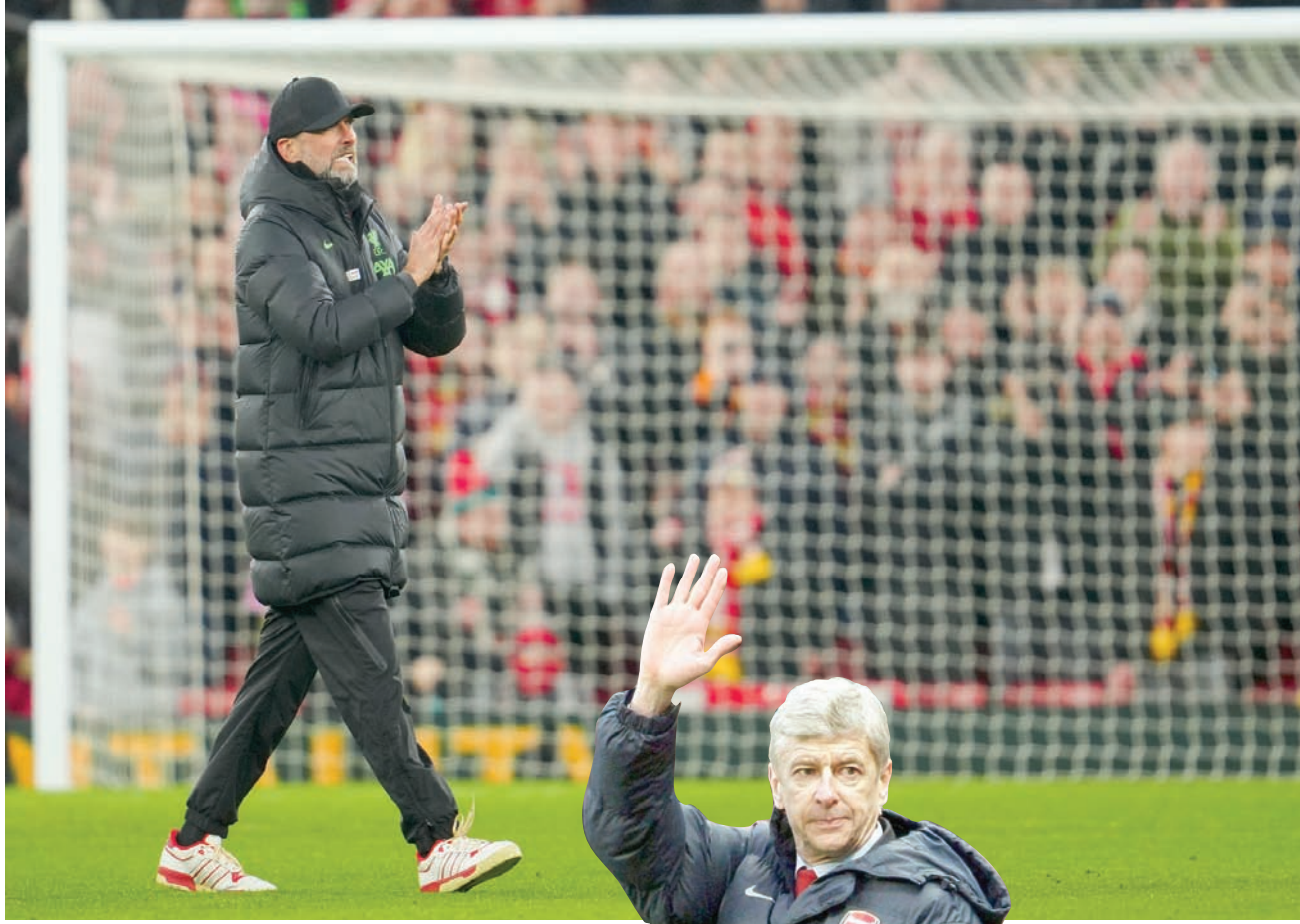
كلوب صدم جماهير ليفربول بقرار الرحيل لكنه ترك بصمة في قلوب محبيه (أ.ب.)

وقال أحد مشجعي ليفربول عن رحيل كلوب، وهو يبكي على تطبيق «تيك توك»: «ربما يكون هذا أسوأ يوم في حياتي». وفي المقابل، كانت اللافتة الشهيرة في ملعب هاوثورنر في عام 2014 تقول: «أرسين، شكراً على الذكريات الجميلة، لكن حان الوقت للرحيل». وبينما كان أرسنال الذي بناه فينغر يستعد لاستضافة الفريق الذي بناه يورغن (المباراة التي انتهت بفوز أرسنال على ليفربول بثلاثة أهداف مقابل هدف وحيد)، يتعين على أرسنال على ليفربول بثلاثة أهداف مقابل هدف وحيد، يتعين علينا التفكير في الأسباب التي جعلت جمهور النادي يتعامل مع رحيل كلوب و فينغر بهذا الشكل المختلف. في ظاهر الأمر، هناك قدر كبير من التشابه بين الإرث الذي تركه كل