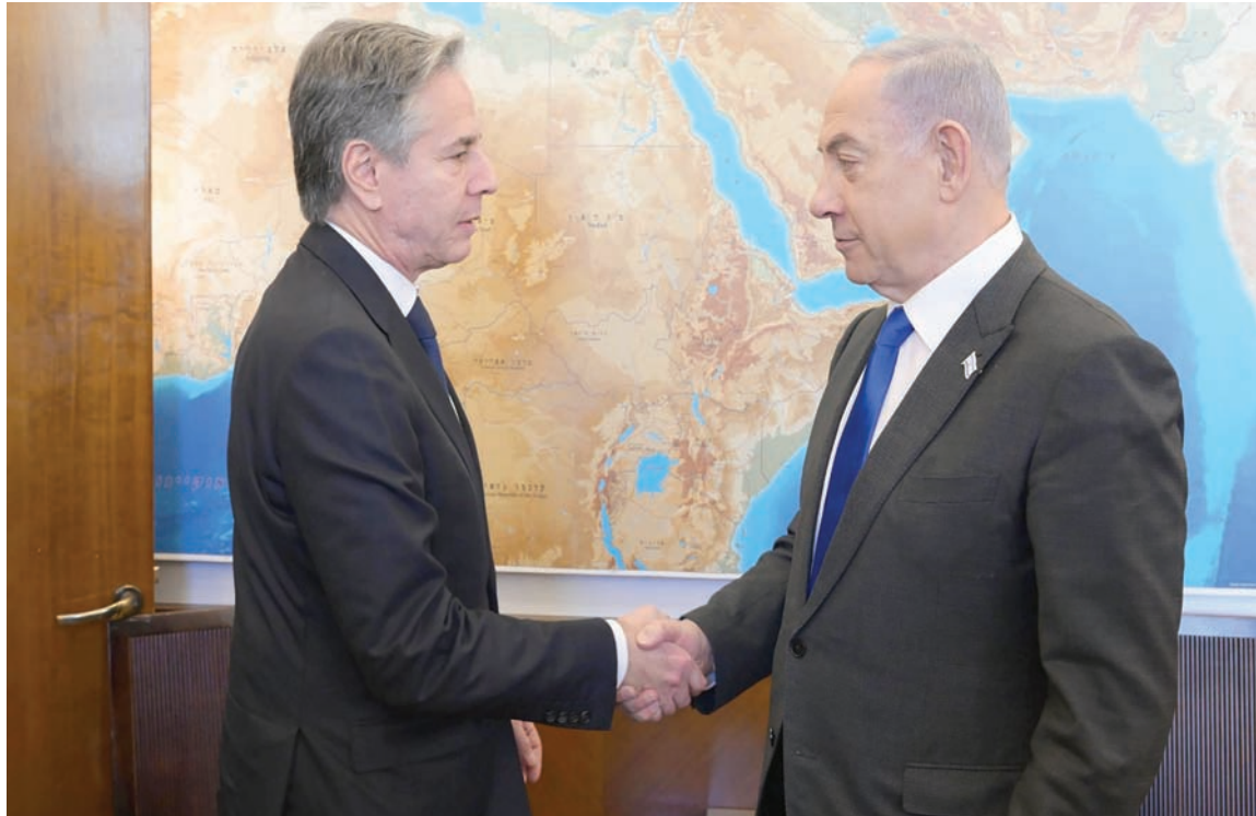
رئيس الوزراء الإسرائيلي مستقبلاً وزير الخارجية الأميركي في القدس أمس