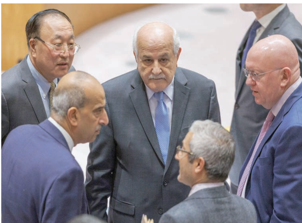
مندوبو دول عربية لدى الأمم المتحدة معهم المندوب الفلسطيني خلال تشاور مع المندوبين الروسي والصيني قبل جلسة لمجلس الأمن بشأن الحرب في غزة 19 ديسمبر 2023 (إ.ب.أ)

السعودية طالبت المجتمع الدولي مجدداً - وعلى وجه الخصوص - الدول دائمة العضوية في مجلس الأمن، والتي لم تعترف حتى الآن بالدولة الفلسطينية، ب«أهمية الإسراع على حدود 1967 وعاصمتها القدس الشرقية، ليتمكن الشعب الفلسطيني من نيل حقوقه