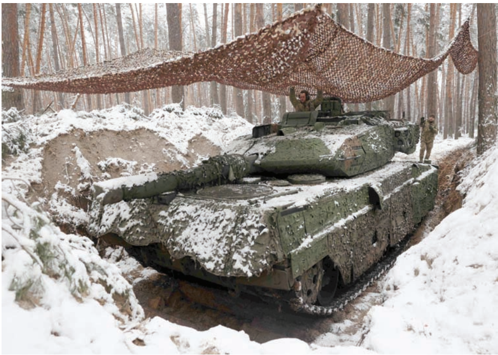
جندي أوكراني يجلس داخل دبابة ألمانية الصنع من نوع «يوبيارد 2 إيه 5» بالقرب من خط المواجهة

ورغم أن شولتس تحدث خلال المؤتمر الصحافي مع أتال قبل أيام، عن «ثقة كبيرة» بأن المساعدات الأميركية والأوروبية لأوكرانيا ستستمر لأن الرئيس الروسي «يراهن على توقفها، وهو ما لا يمكن السماح به»، فإن المخاوف في برلين كبيرة؛ ليس فقط من توقف المساعدات بل أيضاً من عودة ترمب الذي كان تعهد في رئاسته الأولى بوقف الدعم لحلف شمالي الأطلسي، ويدعو اليوم لوقف المساعدات العسكرية لأوكرانيا. وهذه المخاوف تجلت في إعلان بولندا أنها تستعد لحرب قد تكون مقلبة مع روسيا. ولكن ألمانيا جيشها الهرم، تعلم بأنها ما زالت بعيدة جداً عن أي استعدادات تخولها صد أي هجوم روسي من دون دعم أميركي.