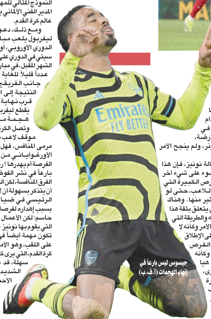
جيسوس ليس بارعاً في إنهاء الهجمات

فترة الانتقالات الشتوية لم تأت بجديد وعلى هاو بدء حملة الإصلاح في الصيف