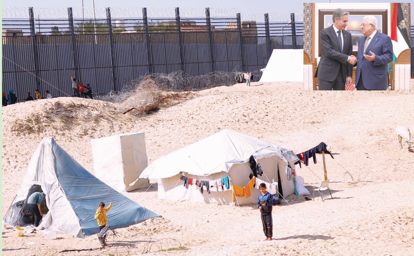
ناجون فلسطينيون أمام مخيمهم في رفح بجنوب غزة أمس وفي الإطار الرئيس الفلسطيني محمود عباس لدى لقائه وزير الخارجية الأمريكي أنتوني بلينكن في رام الله أمس

التاريخي والذي لم يتخل عن مسؤولياته تجاه القضية الفلسطينية». وعد الهباش أن الموقف السعودي يمثل دعماً وإسناداً كبيرين للموقف الفلسطيني، وأنه يعطي مزيداً من الزخم لحراك القيادة الفلسطينية من أجل إنهاء الاحتلال. في غضون ذلك، طلب الرئيس الفلسطيني محمود عباس من وزير الخارجية الأمريكي أنتوني بلينكن، خلال لقائهما في رام الله أمس، اعترافاً أميركياً بالدولة الفلسطينية، وتمكينها من الحصول على العضوية الكاملة في الأمم المتحدة، مؤكداً أن الدولة الفلسطينية مفتاح الأمن والسلام.