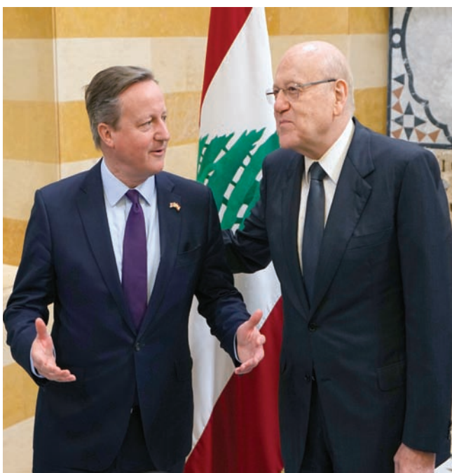
رئيس الحكومة اللبنانية نجيب ميقاتي مستقبلاً وزير الخارجية البريطاني ديفيد كاميرون

ووعده بوضعهم في صورة أي مقترحات يجري بلورتها، لكن المصادر أكدت أنه «لم يظهر أن هناك شيئاً ملموساً حتى الآن».