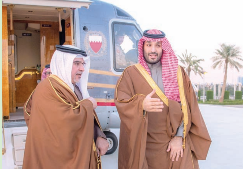
ولي العهد السعودي مستقبلاً ولي العهد البحريني في الرياض