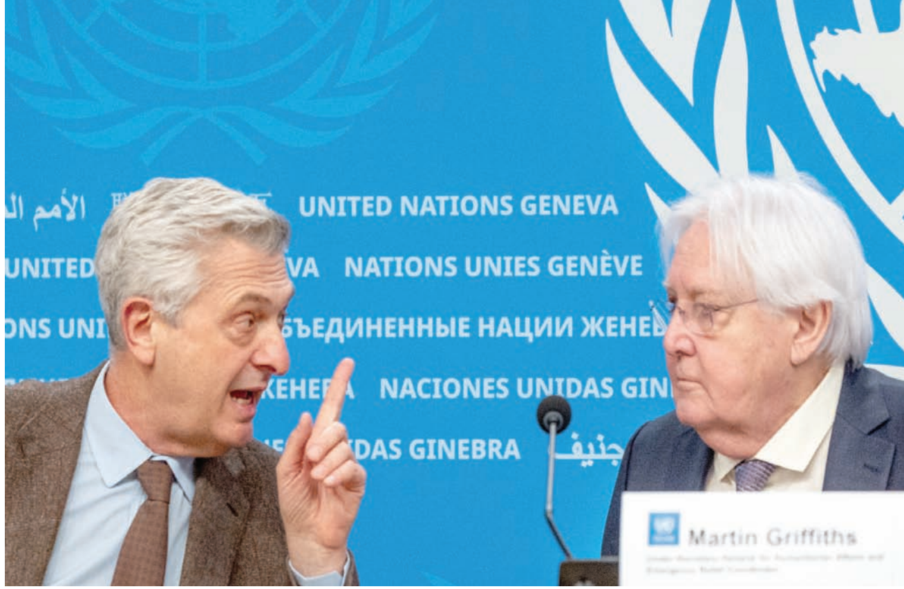
وكيل الأمين العام للأمم المتحدة مارتن غريفيث (يمين) والمفوض السامي للأمم المتحدة للشؤون الإنسانية فيليبو غراندي في مؤتمر صحفي الأربعاء في جنيف

ومنذ أبريل (نيسان) الماضي، يدور قتال بين الجيش السوداني بقيادة عبد الفتاح البرهان، ونائبه السابق قائد «قوات الدعم السريع» محمد حمدان دقلو (حميدتي)، وفشلت الجهود الدبلوماسية للتوصل إلى مفاوضات سلام حتى الآن. وأعلن غريفيث، الأربعاء، أن «طرفي النزاع السوداني اتفقا على عقد اجتماع على الأرجح في سويسرا، لبحث مسألة إكمال المساعدات الإنسانية»، وقال: «خلال الأسبوعين الماضيين، أجرت اتصالات مع القادة العسكريين (البرهان، وحيمدتي) لوقف القتال بينهما» بشأن إكمال المساعدات.