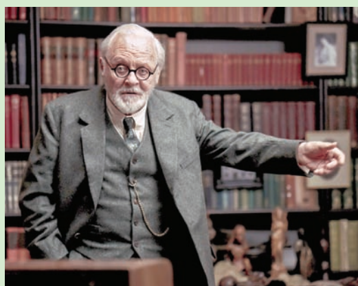
أنتوني هوبكنز بشخصية فرويد

وأضاف هوبكنز: «أنت تتعلّم من نض السيناريو. ما فعله هو أنني أخذ النض، والسطور، والكلمات، وأحفر (أبحث) تحتها قليلاً (عن المعاني والمضامين)، مثل من يبحث عن الحصى في الشارع».