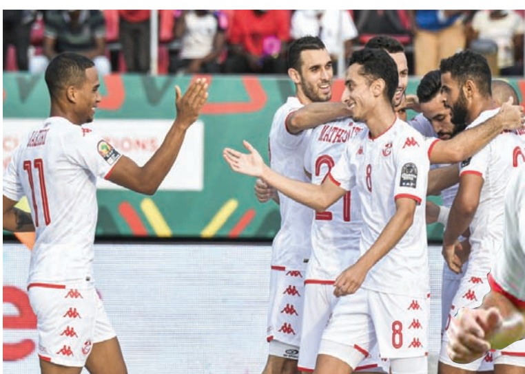
المنتخب التونسي وفرحة فوزه التاريخي على نظيره الفرنسي في مونديال 2022

واكتسب المنتخب التونسي قوة دفع جيدة قبل مشاركته في النسخة المقبلة بامم أفريقيا، عقب فوزه 4 - صفر على ضيفه منتخب ساوتومي وبرنسيب، و1 - صفر على مضيفه منتخب مالاي،