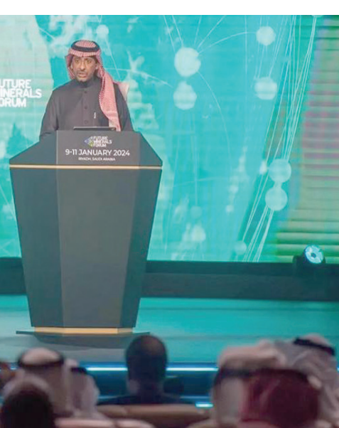
وزير الصناعة والثروة المعدنية خلال افتتاحه النسخة الثالثة من مؤتمر التعدين الدولي (الشرق الأوسط)

وأشار إلى أن النتائج التي تم الإعلان عنها هي نتيجة للجهود التي بُذلت خلال السنوات الماضية في عمليات الاستكشاف والمسح الجيولوجي التعديني، إضافة إلى الجهود الكبيرة في إصدار تراخيص الاستكشاف عن المعادن، التي تضاعفت خلال السنوات الثلاث الماضية بأربعة أضعاف، مقارنة بعدد التراخيص خلال الأعوام الستة التي سبقت صدور نظام الاستثمار التعديني الجديد الذي أسهم في رفع حجم الإنفاق على الاستكشاف من 70 ريالاً إلى 180 ريالاً لكل كيلومتر مربع، الأمر الذي يؤكد جدوى الاستثمار في عمليات الاستكشاف التعديني. وأعلن الوزير السعودي، خلال المؤتمر، عن الجولتين الخامسة والسادسة من برنامج التراخيص للاستكشاف اللتين تتحان الوصول إلى 33 موقعاً استكشافياً هذا العام، وقال: «الأول مرة،