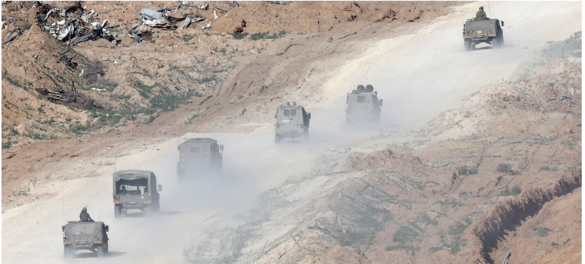
أليات إسرائيلية على الحدود مع قطاع غزة الأربعاء

ومنذ بداية الحرب في غزة تخشى إسرائيل أن تتحول الضفة إلى جبهة أخرى، لكن هذا المخاوف وصلت إلى مرحلة تقييمات حقيقية.