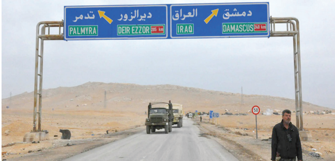
معبور البوكمال الحدودي في محافظة دير الزور يعد المعبر الرئيسي بين سوريا والعراق