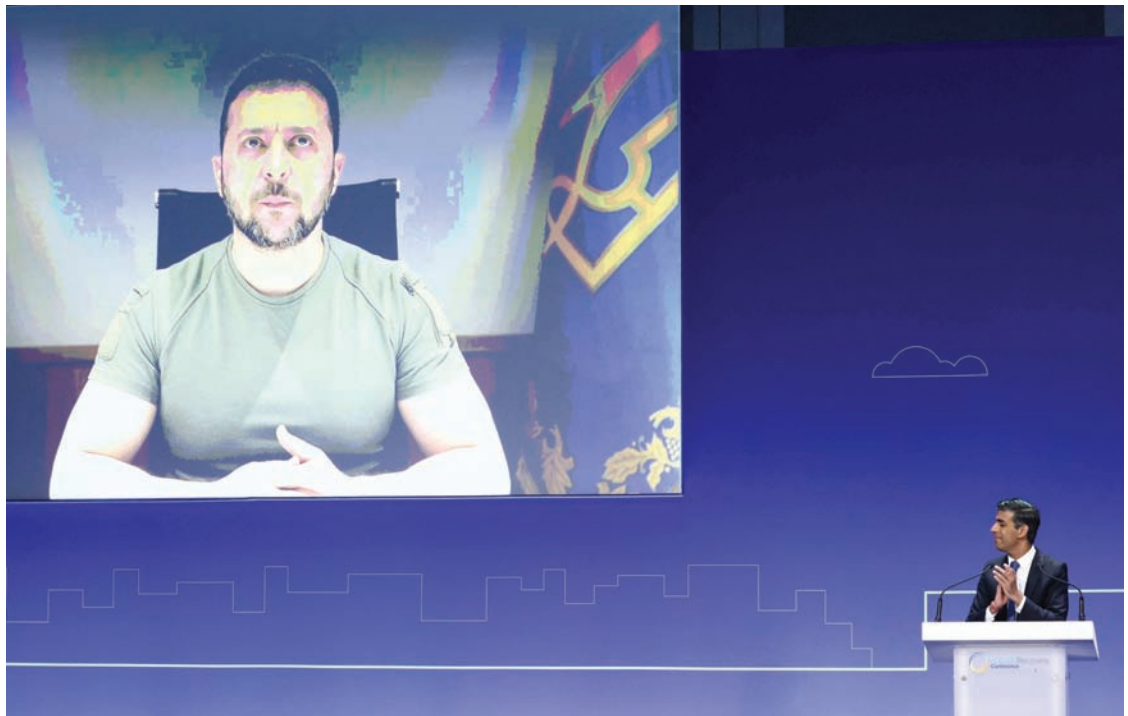
رئيس الوزراء البريطاني ريشي سوناك يقدم رئيس أوكرانيا فولوديمير زيلينسكي في افتتاح مؤتمر «تعافي أوكرانيا» في لندن يونيو الماضي

واشنطن: «الشرق الأوسط» تعددت عدة دول غربية العام الماضي بتقديم مساعدات لأوكرانيا بمليارات الدولارات لإعادة الإعمار من تبعات الحرب الروسية على البلاد. والسؤال المطروح هو: كيف يمكن إنفاق هذه الأموال على الوجه الأمثل لضمان تحقيق الازدهار للأوكرانيين؟ يقول المحلل السياسي دوغ إيرفنج في تقرير نشرته مؤسسة البحث والتطوير الأميركية (راندا) إن خبراء الاقتصاد في أوكرانيا احتفظوا بحصيلة قائمة منذ بدأ الجيش الروسي اجتياح حدودهم في أوائل عام 2022، إذ بلغ عدد المنازل الخاصة التي دمرت في السنة الأولى من الحرب 66 ألفاً و618 منزلاً، إلى جانب ثمانية آلاف و746 كيلومتراً من الطرق الرئيسية التي أنت عليها جنازير الدبابات، والمتفجرات الشديدة، ويتتبع الاقتصاديون عدد المدارس التي تحولت إلى أنقاض والتي بلغت 434 في السنة الأولى من الحرب، وأيضاً عدد محطات الطاقة الكهرومائية التي تضررت، أو دمرت، وتبين أن جميعها قد نالها المصير نفسه. وهم يعرفون عدد مستعمرات النحل الزراعية التي تم القضاء عليها في عام واحد من القتال، والتي بلغت 87 ألفاً وتعطي أرقامهم فكرة عن ضخامة جهود إعادة الإعمار اللازمة عندما يتوقف إطلاق النار. لكنها مجرد البداية. ودرس الباحثون في مؤسسة راند عبر عقود من جهود التعافي، من أوروبا ما بعد الحرب العالمية الثانية إلى ما بعد إعصار كاترينا الذي ضرب مدينة نيو أورلينز،