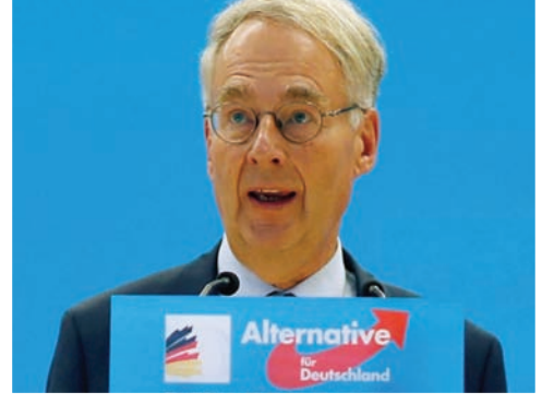
صورة أرشيفية لرولانده هارتفيغ في يناير 2018

وتناقش الحكومة كذلك تقوية وحفظ وصول حزب «البديل لألمانيا» إلى السلطة، علماً بأن استطلاعات السراي تشير إلى أنه أصبح ثاني