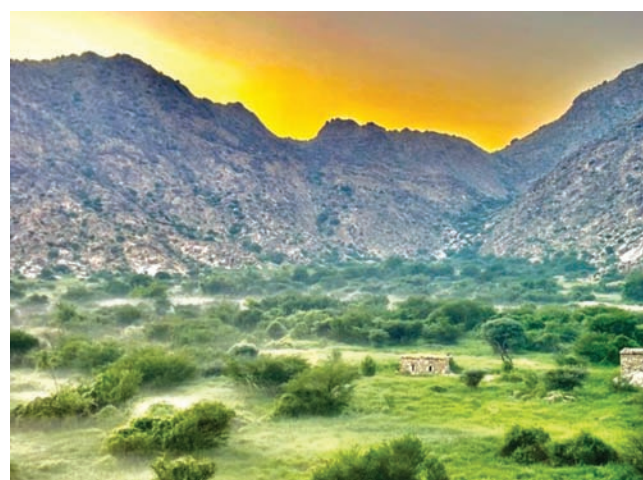
طبيعة خلابة تسحر القلوب (الشرق الأوسط)

النحو الفريد، والتعامل مع كافة العوامل الجغرافية والمناخية، التي مكنتهم من تفادي سريان الوبدان ببناء كثير من البيوت على مرتفعات صغيرة بزوايا مختلفة لكل بيت، مع استخدام أحجار ذات مقاسات محددة وجودة عالية قادرة