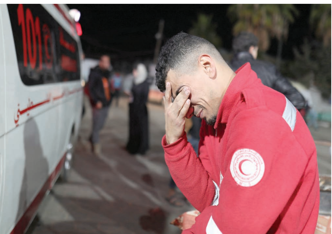
مسعف فلسطيني يبكي زملاء له من الهلال الأحمر الفلسطيني قتلوا بغارة إسرائيلية في دير البلح الأربعاء

ولطالما اعتبرت إسرائيل المحاكم الدولية والمحاكم التابعة للأمم المتحدة، مُنحازة وغير متبصرة. تقول خبيرة القانون الدولي، ماكتاير، إن جنوب أفريقيا «سوف تواجه صعوبة في تجاوز عتبة» إثبات الإبادة الجماعية. وأضافت في رسالة بالبريد الإلكتروني لوكالة أسوشيتد برس: «إنها ليست ببساطة مسألة قتل أعداد هائلة من الناس. يجب أن تكون هناك نية لتدمير فريق من الناس (مصنفين حسب العرق أو الدين مثلاً) كلياً أو جزئياً، في مكان معين».