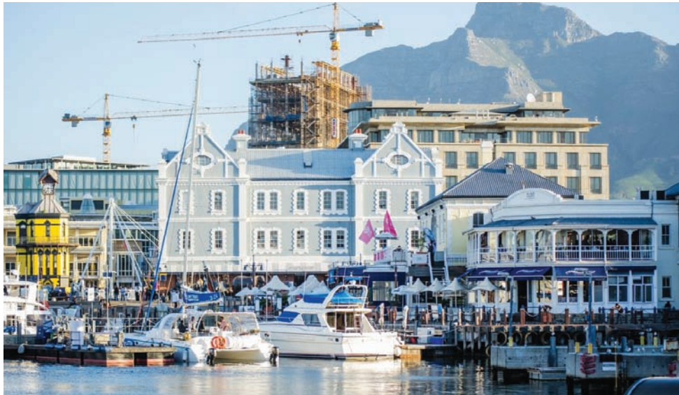
كيب تاون تتمتع بطبيعة خلابة (الشرق الأوسط)

في كيب تاون يمكنك أن تتنقل بين زرقاء مياه الأطلسي وشواطئه، الذي يقصده السكان للسباحة والجلوس على شواطئه والاستراحة في مقاهيه ومطاعمه، والمناطق الجبلية التي منها تكشف مشاهد جميلة لمدينة يعاني فيها الجبل البحر. ومن المشاوير الجبلية التي تمتع السياح، الصعود إلى «تابيل ماونت» أو «جبل الطاولة»، ويطلق عليه هذا الاسم، لقمته المسطحة التي تتيح للزوار قضاء وقت ممتع، وتأمل هذه