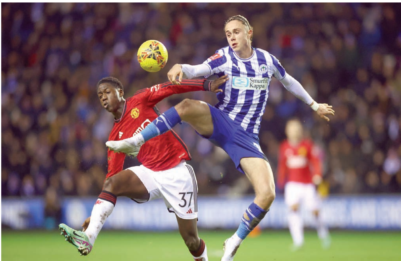
ماينو أكد في مواجهة ويغان في كأس إنجلترا إمكانية أن يصبح ركيزة أساسية في خط وسط مانشستر يونايتد

لكن اللاعب الشاب تعرض للإصابة في يوليو (تموز) الماضي خلال استعدادات الفريق للموسم الجديد، ولولا ذلك لكان من الممكن أن يظهر