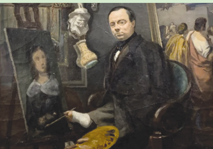
صورة ذاتية تظهره وهو يرسم بقدمه (معرض فيني)