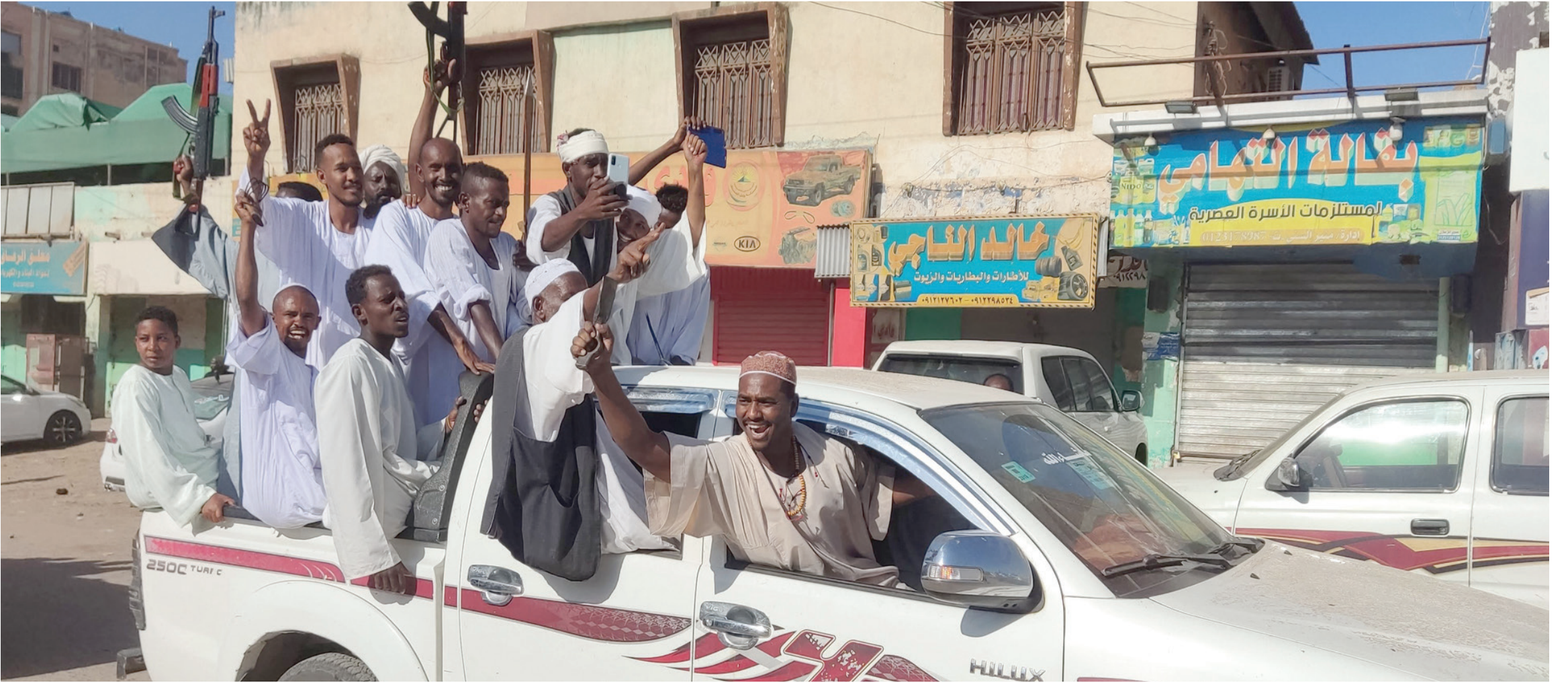
سودانيون مؤيدون للجيش يلوحون بالأسلحة في ولاية القطارف 29 ديسمبر الماضي