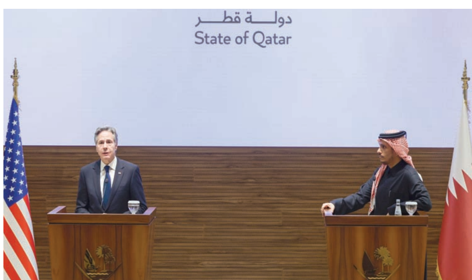
المؤتمر الصحافي الذي جمع وزير الخارجية القطري ونظيره الأميركي في الدوحة الأحد

ودعا بيان لمنحدي عائلات المختطفين مجلس الحرب إلى المصادقة على أي صفقة تتضمن إعادة أبنائهم أحياء. وجاء في بيان: «إن التقارير حول الصفقة الجديدة تعطي بعض الأمل للعائلات اللقطة على مصير أبنائهم الذين يقعون في أنفاق (حماس) منذ فترة طويلة».