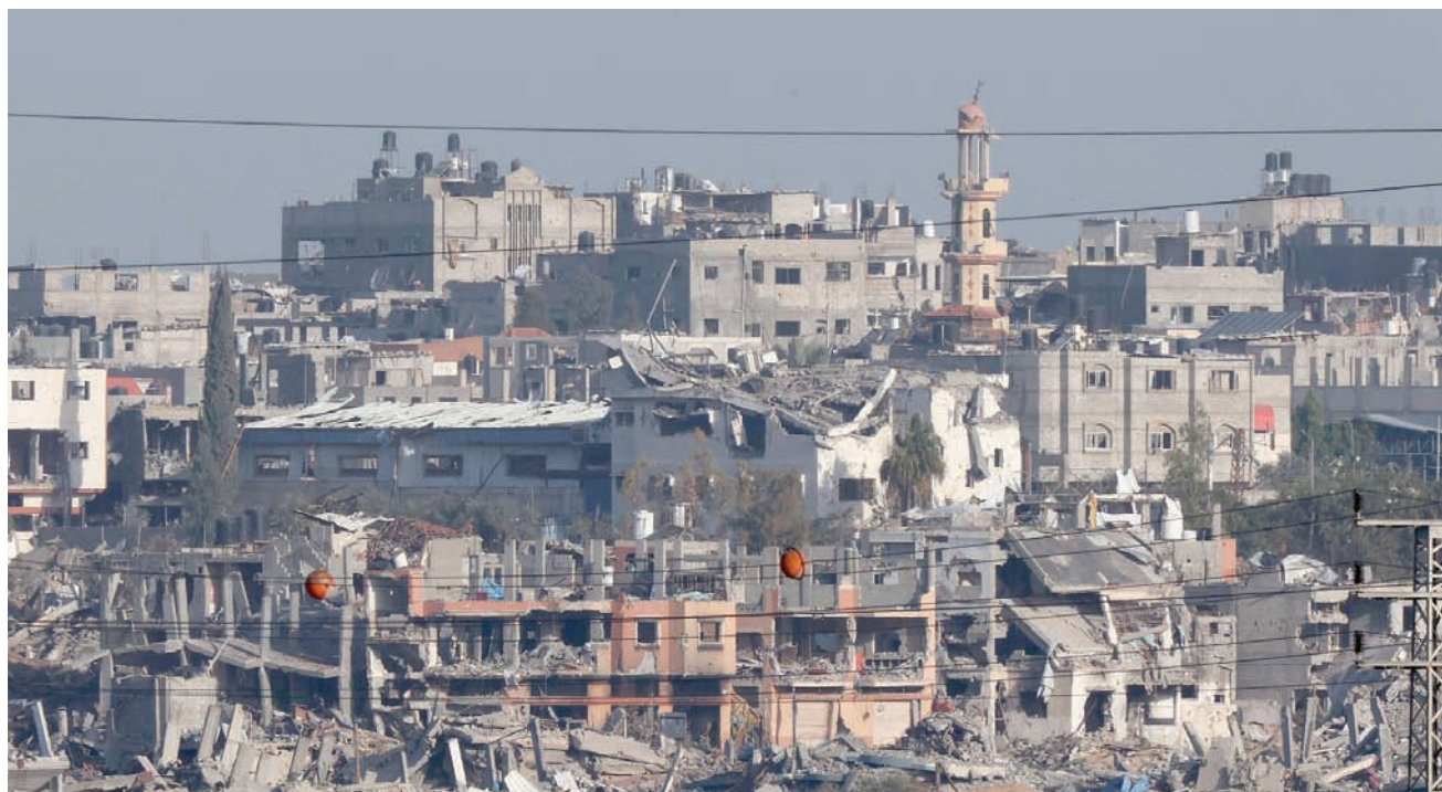
دمار في غزة في صورة مأخوذة من الجانب الإسرائيلي من الحدود الأربعاء (أ.ف.ب)

كما قتلت إسرائيل 4 مسعفين في قصف سيارة إسعاف في شارع صلاح الدين وسط قطاع غزة. وأكد الهلال