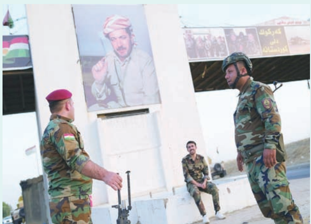
عناصر من البشمركة يتموضعون تحت صورة لمسعود بارزاني في ضواحي كركوك

بغداد: فاضل التمشي ومن المرجح أن يتعرض المكونات الأخرى في المدينة على هذه الخطة، لا سيما الإطار التنسيقي الذي أعلن الاعتماد على تشكيل حكومات محلية، وفقاً للوزان الانتخابية.