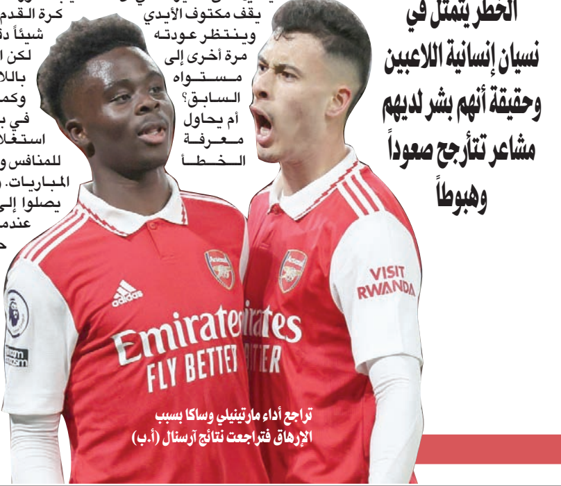
تراجع أداء مارتينيلي وساكا بسبب الإرهاق فتراجعت نتائج أرسنال

نسيان إنسانية اللاعبين وحقيقة أنهم بشر لديهم مشاعر تتأرجح صعوداً وهبوطاً