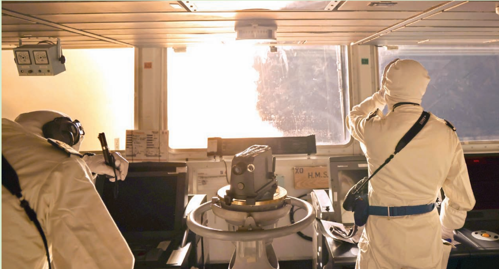
صورة وزعتها وزارة الدفاع البريطانية أمس تُظهر عملية إطلاق صواريخ في البحر الأحمر من على متن المدمرة البريطانية «إتش إم إس دايموند»