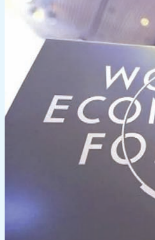
يقعد الاجتماع السنوي للمنتدى الاقتصادي العالمي 2024 في دافوس تحت شعار «تعزيز الثقة» (الشرق الأوسط)

من المتوقع أن تتواصل هجمة المخاطر البيئية على مشهد المخاطر في الأطر الزمنية المختلفة، في الوقت الذي دعا التقرير القادة العالميين إلى إعادة النظر في الخطوات الواجب اتخاذها لمواجهة المخاطر العالمية. وأوصى التقرير بتعزيز جهود التعاون العالمي على تسريع بناء حواجز حماية من المخاطر الناشئة الأكثر إلحاحا، كالقيام بالتوقيع على اتفاقيات للتعامل مع دمج الذكاء الاصطناعي في عملية اتخاذ القرارات المتعلقة بالنزاعات.