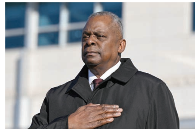
أوستن لدى حضوره حفل ترحيب بنظيره الكوري الجنوبي في 13 نوفمبر 2023

قال خبراء قانونيون إن أوستن ربما انتهك القانون الأمريكي بشأن «الإبلاغ عن الشغور الوظيفي»، الذي يلزم الوكالات التنفيذية إبلاغ مجلسي النواب والشيوخ عن حالات غياب كبار المسؤولين، واسم أي شخص يعمل بالنيابة عنهم. وهذا القانون إجرائي إلى حد كبير، ولا ينص على أي عقوبات، وأشار خبراء قانونيون، وفق «رويترز»، إلى أنه يبدو أن أوستن انتهك القانون بصورة واضحة، لكن من المرجح أن يكتفي بايدين بتوبيخه وتحذيره فحسب، وهي الحال أيضاً بالنسبة لكبار الموظفين في وزارة الدفاع.