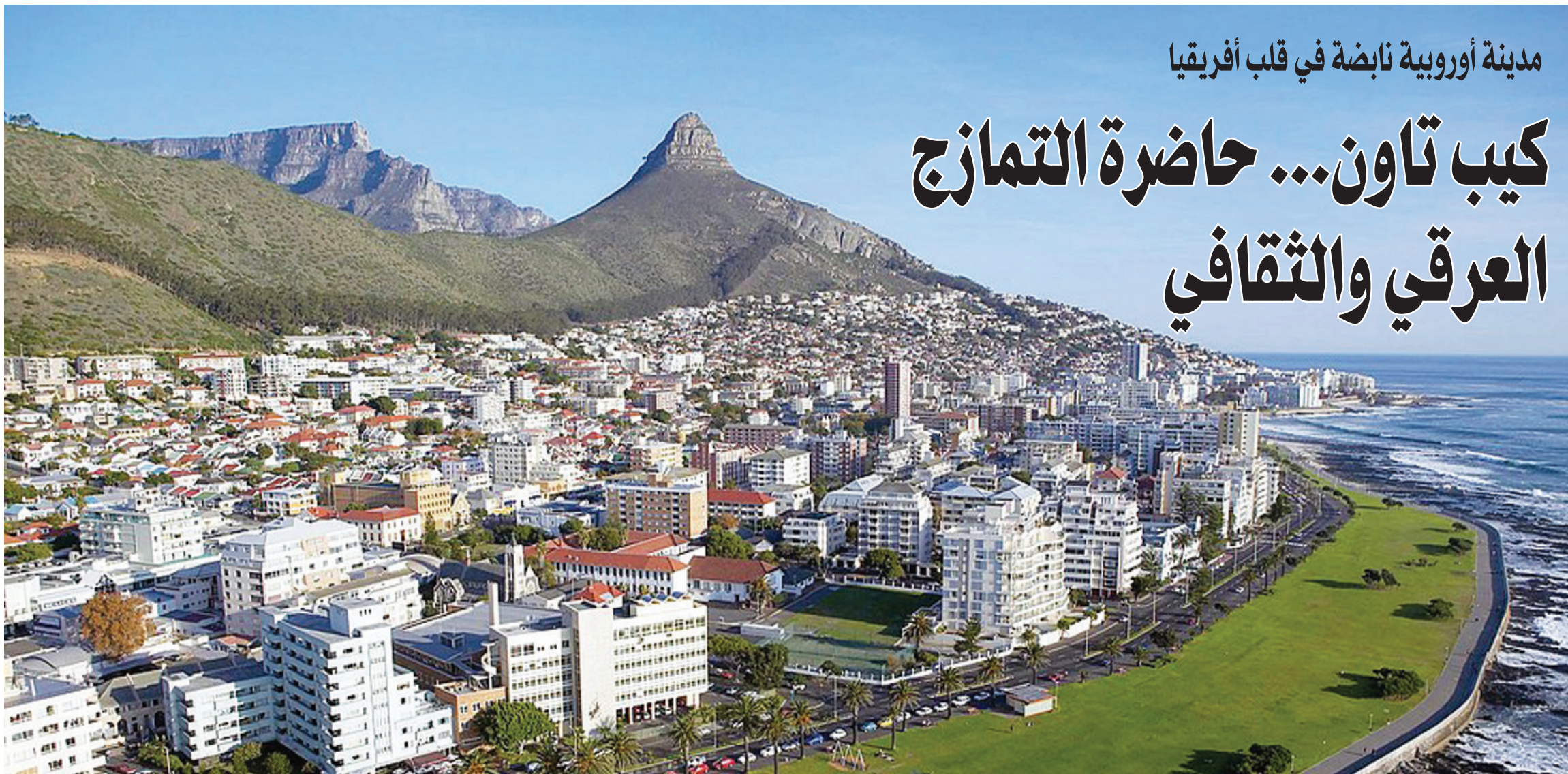
كيب تاون مدينة ساحرة (الشرق الأوسط)

المدينة الواعدة واكتشاف جمالياتها من فوق. الصعود بجناح سيارة أو استقلال الباص ومن ثم تأخذ «التلفريك» أو المقصورات المعلقة لبلوغ القمة.