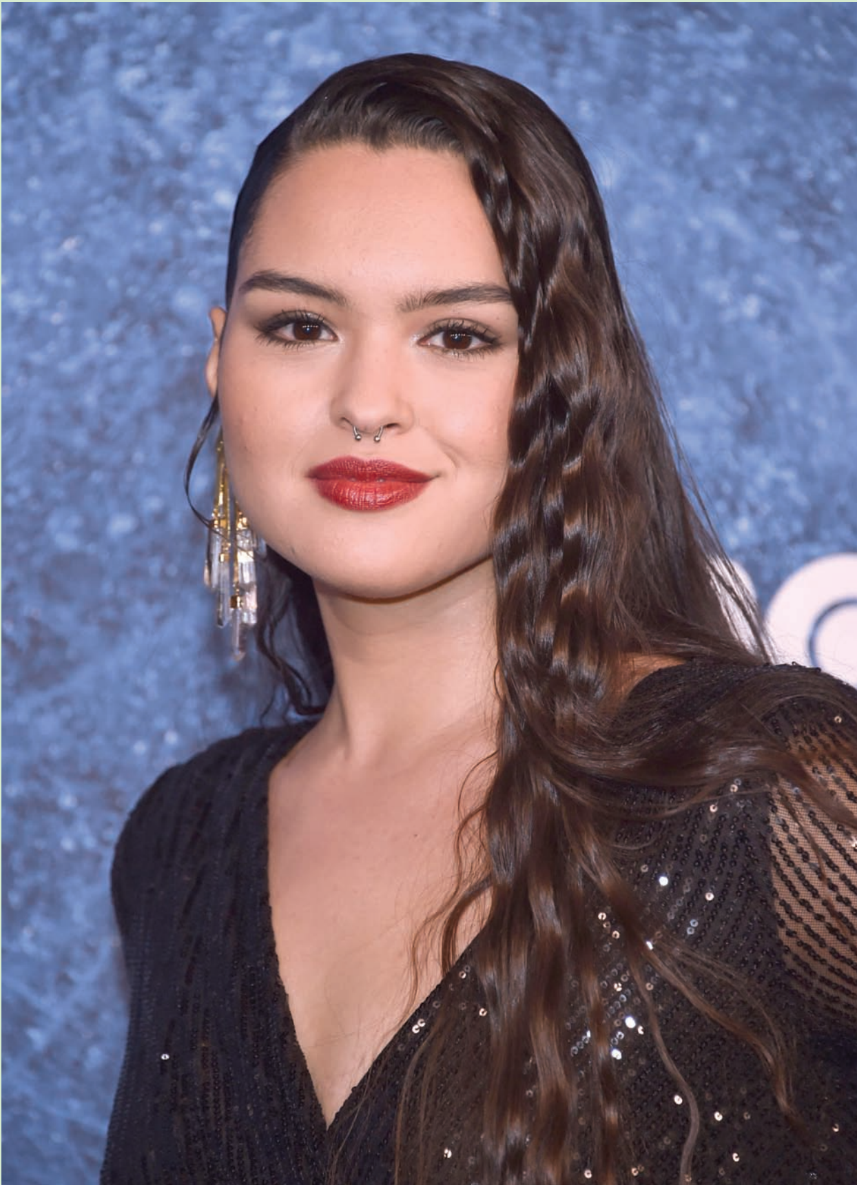
الممثلة آن لامب لدى حضورها العرض الأول لمسلسل «ترو ديكتيف» في مسرح باراماونت بلوس أنجلوس أمس (أ.ف.ب)

والمضحك أن بعض المهريين من جنوب العراق، لجأوا إلى وسيلة تهريب غير مسبوقة، إذ أتوا بسرب من الحمام الزاجل وحفظوه بالحبوب المحذرة، وجاء فيما نُقلت جريدة «الراي» الكويتية أن رجال الجمارك تتبعوا حماماً زاجلاً قادماً من العراق، وبعد ضبطه اكتشفوا أن كل حمامة تحمل 178 حبة مخدرة في حزام ملفوف حولها.