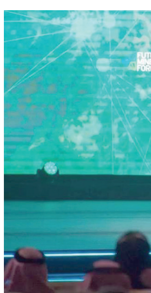
وزير الصناعة والثروة المعدنية خلال افتتاحه النسخة الثالثة من مؤتمر التعدين الدولي (الشرق الأوسط)

أما وزير الاقتصاد والتخطيط كافي، ومن المتوقع أن يرتفع الطلب على المواد في السنوات المقبلة لكون أضعاف ما هو عليه اليوم. وأورد الوزير أن إعادة تشكيل سلسلة الإمداد العالمية خلال العقود المقبلة ستطلب مزيداً من