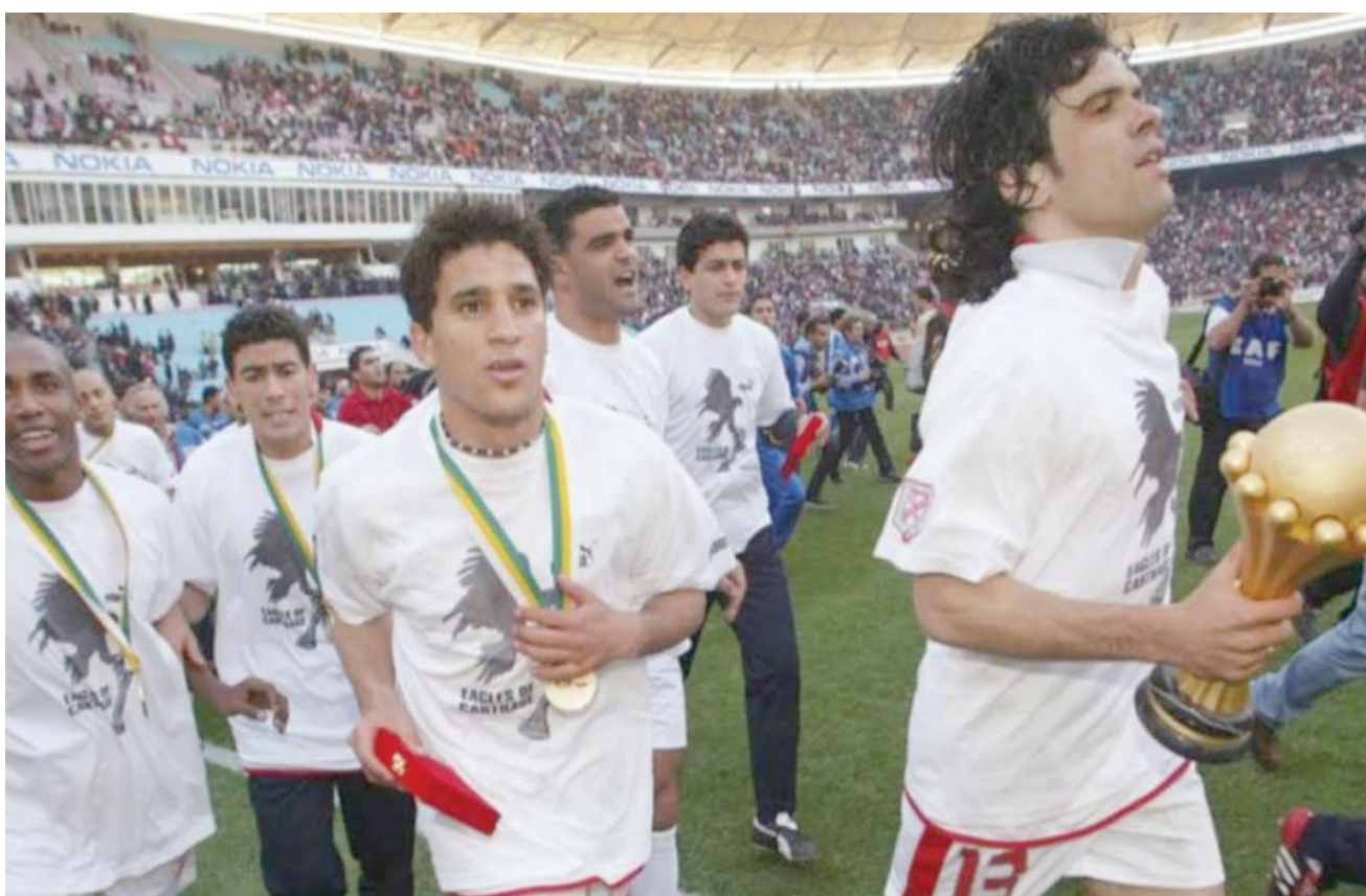
تتويج منتخب تونس بكأس أمم أفريقيا 2004

وتجدد الموعد بين المنتخبين في مباراة تحديد المركزين الثالث والرابع بنسخة عام 2000، التي حسمتها جنوب أفريقيا أيضاً بركلات الترجيح، قبل أن تميل الكفة للمنتخب التونسي في آخر مواجهة بينهما بامم أفريقيا، عقب فوزه على جنوب أفريقيا بمرحلة المجموعات لنسختي 2006 و2008. كما سيكون منتخب تونس على موعد «معتاد» مع منتخب مالي في أمم أفريقيا للمرة الرابعة في