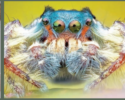
صوّب عدسته نحو «العالم الغريب» للحشرات

خلال نومها. وفي نوفمبر (تشرين الثاني) الماضي، حصل على جائزة ضمن فئة «المكرو» لجوائز التصوير الفوتوغرافي البريطانية عن صورته التي تُظهر عنكبوتاً في قيو تحمل أكياس بيضها.