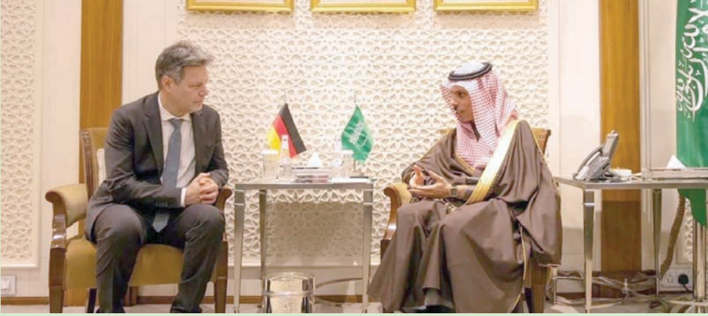
وزير الخارجية خلال استقباله المسؤول الألماني

الساحتين الإقليمية والدولية. حضر الاستقبال الأمير عبد الله بن خالد بن سلطان سفير السعودية لدى ألمانيا الاتحادية، والدكتور سعود الساطي وكيل وزارة الخارجية للشؤون السياسية.