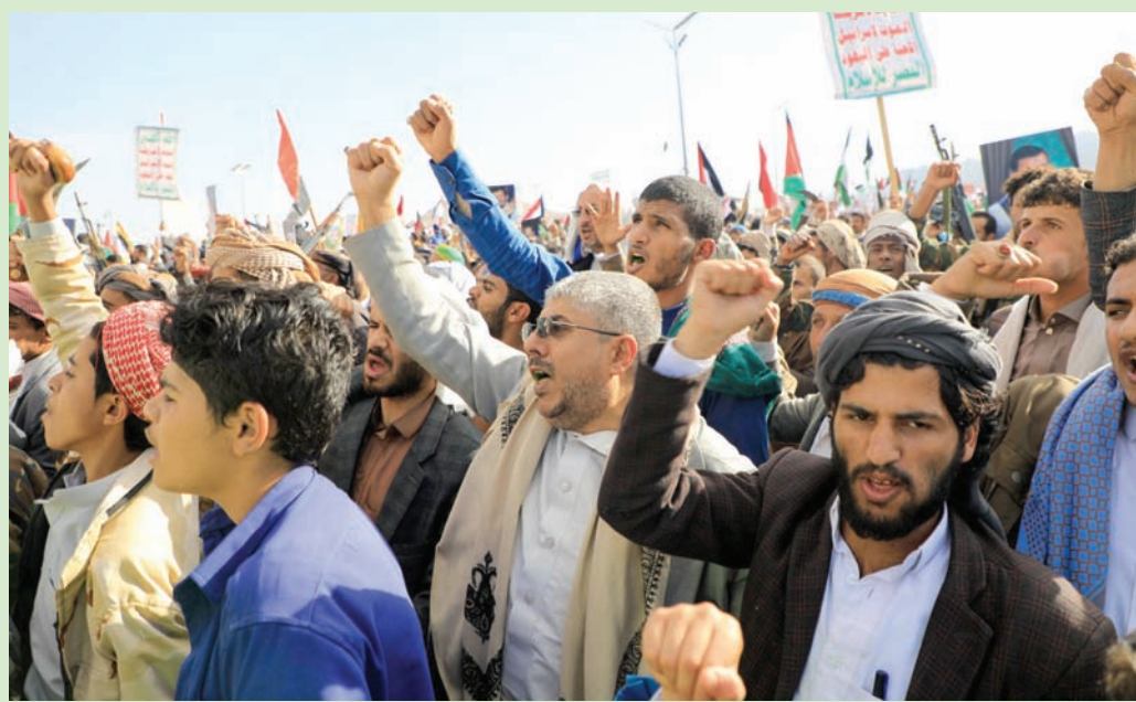
استغل الحوثيون الحرب الإسرائيلية في غزة لتجنيد الآلاف (أ.ف.ب)

جنوب البحر الأحمر، باتجاه ممرات الشحن الدولية حيث كانت تمر عشرات السفن التجارية.