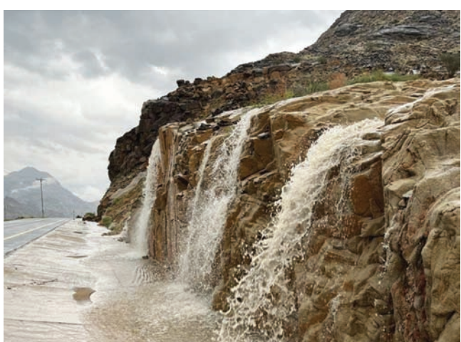
شلالات وادي مراج الذي يعد منطقة سياحية (الشرق الأوسط)

على تحمل هذه الظروف. وما يميز المواقع التاريخية والآثار في «ديار بني هلال» أنها في قلب الطبيعة عند وادي «مراج»، الذي يعد من أجمل المناطق السياحية للمتنزهين لكثرة المياه وجمال الطبيعة التي يمتاز بها، إلى جبال «عفف»، الذي يضم المواقع السياحية البكر والعيون من المباني التراثية التي تحكي سيرة الإنسان في حقبة زمنية مختلفة، كما أن المنطقة تمتاز ببرودة الجو ونقاوته، وجمال الطبيعة وإنتاج بعض الفواكه الصيفية، مما يجعلها هدفاً ومزاراً حقيقياً في قادم الأيام للباحثين عن الجمال والهواء.