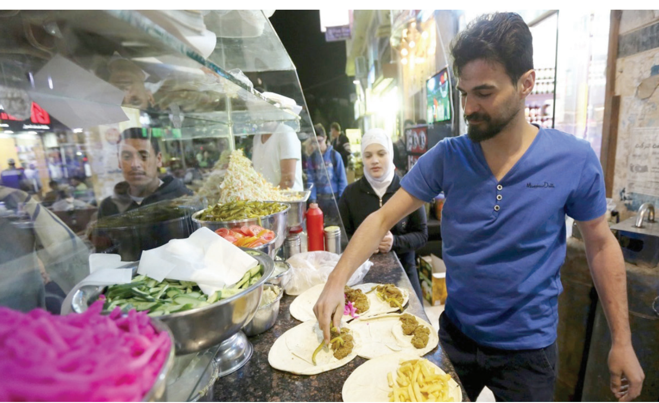
انتشرت محال السوريين في مصر بشكل كبير