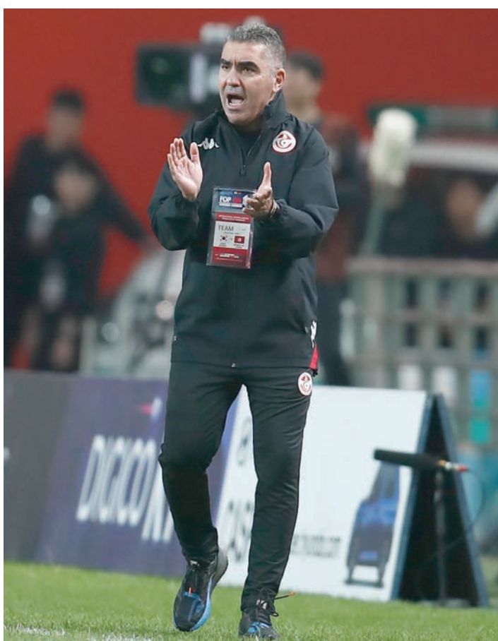
جلال القادري مدرب المنتخب التونسي

مصائب قوم عند قوم فوائد، مقولة لعبت دور البطولة في مسيرة جلال القادري المدير الفني لمنتخب تونس في النسخة 34 لكأس أمم أفريقيا التي ستقام في كوت ديفوار خلال الفترة من 13 يناير (كانون الثاني) حتى 11 فبراير (شباط) 2024. فاز منتخب تونس باللقب مرة واحدة عندما استضاف البطولة في عام 2004 ويستعد لمشاركته الحادية والعشرين عندما يلعب في المجموعة الخامسة التي تضم أيضاً منتخبات جنوب أفريقيا ومالي وناميبيا. لعبت الصدفة دور البطولة في صعود القادري لمنصب المدير الفني لمنتخب تونس بعدما كان مساعداً مرتين الأولى في 7 مباريات مع المدير الفني نبيل معلول في عام 2013 والثانية مساعداً في 17 مباراة للمدير الفني منذر الكبير خلال 7 أشهر بين عامي 2021 و2022. وقرر القادري لمنصب المدير الفني بشكل مؤقت في مباراة نيجيريا بالدور الثاني لكأس أمم أفريقيا الأخيرة 2022 بالكاميرون بسبب إصابة المدرب منذر الكبير بفيروس كورونا، ونجح القادري في الاختيار وقاد نسور قرطاج لدور الثمانية حيث ودع أمام بوركينا فاسو. وقرر الاتحاد التونسي لكرة القدم تعيينه في منصب المدير الفني بشكل مؤقت بعد الخروج من كأس الأمم لكنه نجح في الإختينار من جديد وقاد الفريق للتأهل لكأس العالم قطر 2022. وفي كأس العالم، حقق المنتخب التونسي نتائج جيدة تحت قيادة القادري حيث جمع 4 نقاط في مشواره بالمجموعة الرابعة بعد تعادل سلبياً مع الدنمارك والخسارة بهدف أمام أستراليا قبل فوز تاريخي على فرنسا حامل اللقب بنتيجة 1/0، ولكنه لم يكن كافياً للتأهل للدور الثاني، وإجمالاً قاد القادري المنتخب التونسي في 22