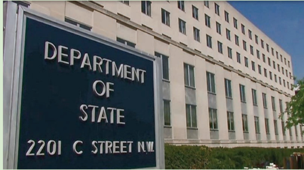
الخارجية الأمريكية تثني على الدور الفعال للسعودية في مكافحة الإرهاب (متداول)

عضوية عدد من المنظمات الدولية والإقليمية. وأشار التقرير إلى انخفاض الهجمات الإرهابية في المملكة بشكل ملحوظ.