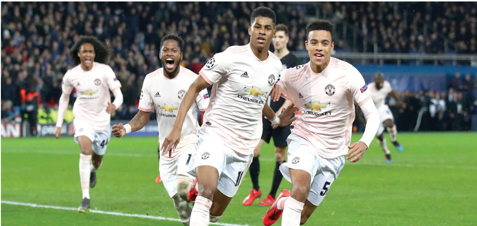
تعال سولسكاير بذكاء مع مجريات اللقاء بسان جيرمان أدى إلى فوز يونايتد في إياب دوري الأبطال 2019

إنها استراتيجية عالية المخاطر، بطبيعة الحال، فلو صمد باريس سان جيرمان، لتساءل الجميع عن الأسباب التي جعلت سولسكاير يطلب من لاعبيه التراجع للخلف، ولماذا لم يلعب بشكل طبيعي ويتقدم للأمام إلا خلال 15 دقيقة فقط من الشوط الثاني. لكن الأمر نجح لأن سولسكاير أدرك أن باريس سان جيرمان كان يعاني من الفشل وعرضة للانهايار تحت الضغط، بينما كان مانشستر يونايتد، في تلك المرحلة، يقف في سولسكاير ثقة تامة