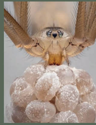
عنكبوت في قيو تحمل أكياس بيضها

غالباً ما يصوّر الحشرات ليلاً للحصول على اللقطة الخالية