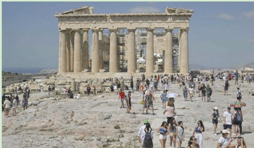
القرار سيبدأ تطبيقه في مطلع أبريل 2025

الراهنة «منخفضة جداً مقارنة بمعدل الأسعار الأوروبي».