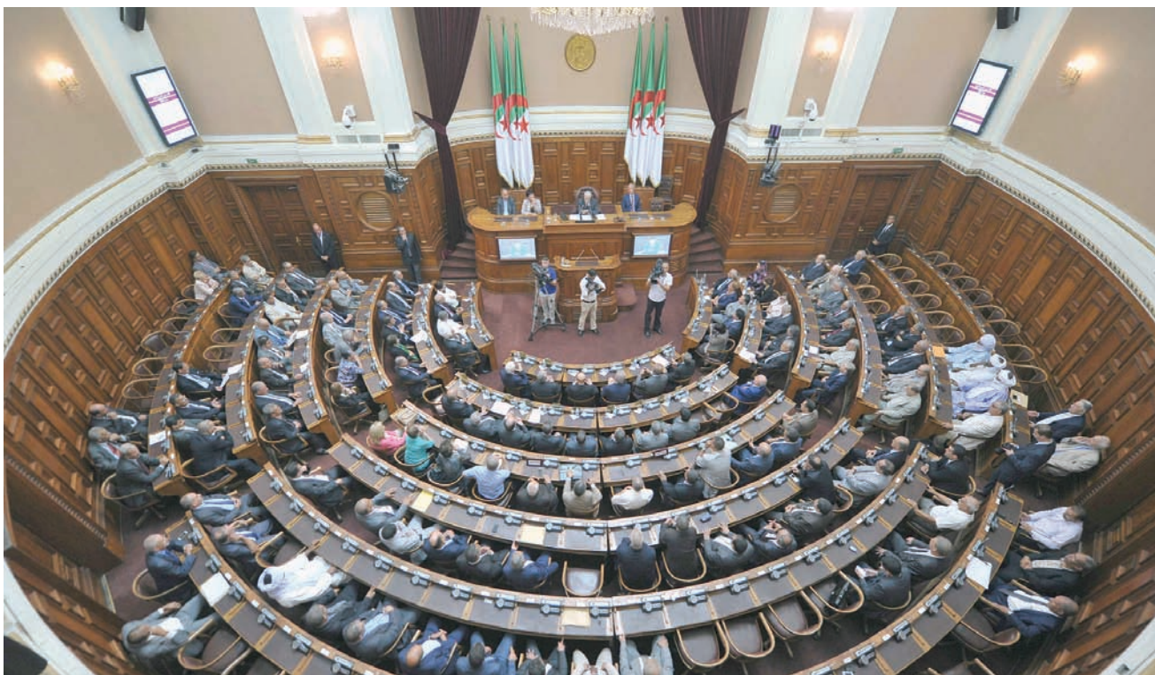
ممثلو أبرز الأحزاب الجزائرية في اجتماع تحت قبة البرلمان الجزائري