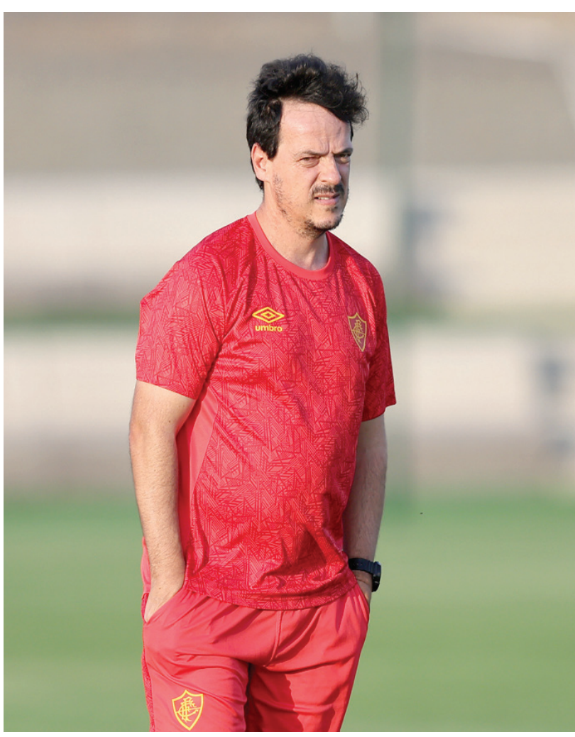
مدرب فلومينينسي توعد بالرد في الملعب (أ.ب.)

وأقر غوارديولا بأن خبرته في البطولة، التي فاز بها مرتين مع برشلونة مرة مع بايرن ميونخ، تجعله حذراً في مواجهات أندية البرازيل وأميركا الجنوبية. وعن لقائه مع محرز الذي رحل عن سيتي الصيف الماضي للانتقال للدوري السعودي قال غوارديولا: «كانت أسبوعية جميلة، كان من الرائع أن نلتقي رياض مجدداً، وأن نتناول العشاء معه ونقضي الوقت سوياً». وواصل: «كان يشكل جزءاً من نجاحنا ولدينا ذكريات مدهلة ويوجد حب كبير لرياض داخل غرفة ملابسنا. كان يفقدنا جداً، لكنه اتخذ قراراً جيداً له ولعائلته، ونتمنى له كل التوفيق».