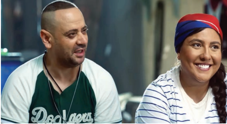
«سنة أولى خطف» (شركة اتحاد الفنانين)

سبب آخر للفشل هو أن هذه الأفلام الكبيرة لها جمهور معين، وسابقاً ما أقدم على مواكبة أفلام ريدلي سكوت التاريخية بكفاءة. المختلف هو أن الفيلم سيعرض على قناة «Apple» والعالمية هذه الأيام فتنال انتقار دورها في العروض المرزلية.