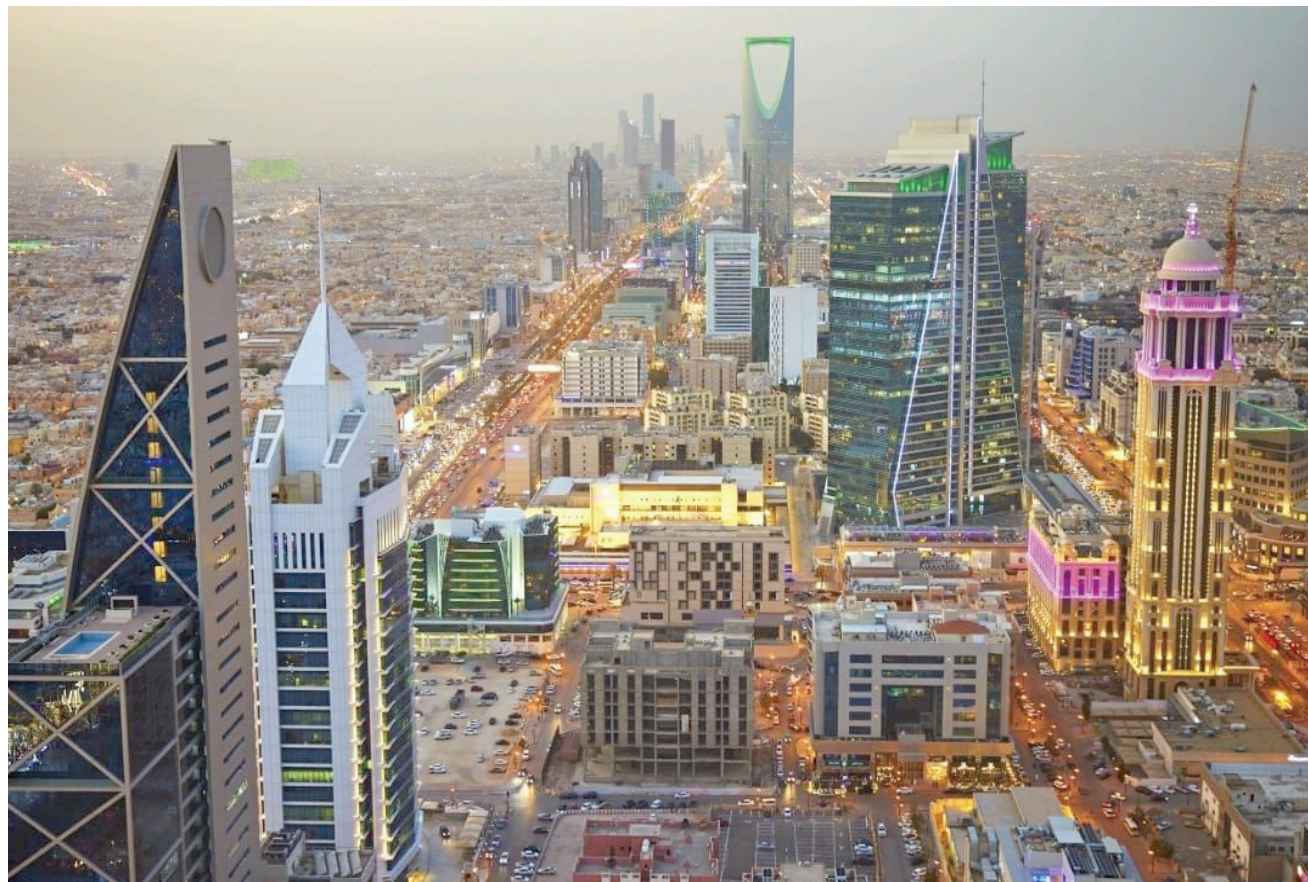
يشهد القطاع الخاص السعودي أداءً إيجابياً يعكس على الأنشطة غير النفطية (الشرق الأوسط)

أورد التقرير أن تدفق الاستثمار الأجنبي بلغت قيمته 6,2 مليار ريال (1,65 مليار دولار)، وجاء منخفضاً بنسبة 20,7 في المائة مقارنة بالشهر الماضي، و17,2 في المائة على أساس سنوي.