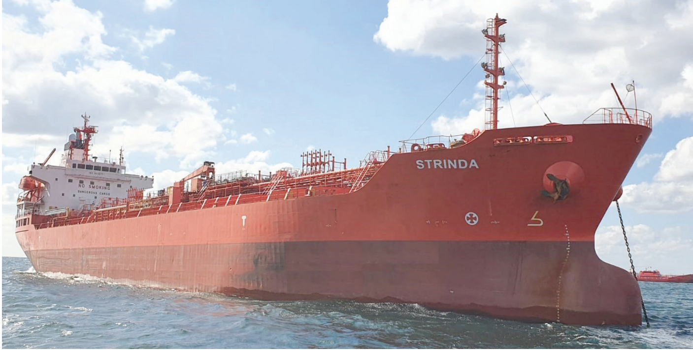
سفينة شحن نرويجية تعرضت لهجوم في البحر الأحمر يوم 12 ديسمبر الحالي

يسعى المصدرون بجد لإيجاد سبل بديلة سواء عن طريق الجو أو البحر لتوصيل السلع الاستهلاكية الرئيسية لتجار التجزئة، إذ تسببت سلسلة من الهجمات في البحر الأحمر في تفاقم مشكلات سلاسل توريد الشحن البحري حول العالم.