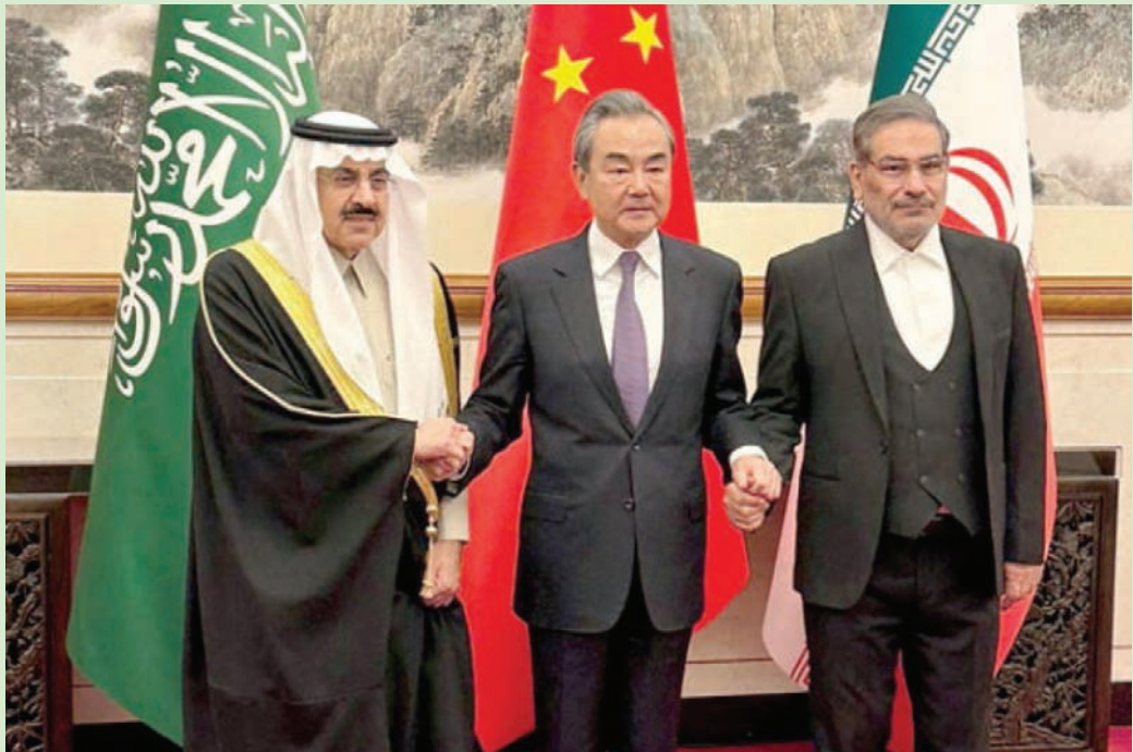
من مراسم توقيع اتفاق استئناف العلاقات بين السعودية وإيران في بكن مارس الماضي

وشهد عام 2023 تنظيم انتخابات مجلس الأمة (يوم الثلاثاء 6 يونيو 2023)، التي شهدت تكريس حياد الحكومة عن مجرياتها، وهو الإجراء الجديد الذي دشنته الشيخ نواف الأحمد، وبداه في صيف 2022، حيث أكد تعهد الحكومة بعدم التدخل في الانتخابات، وكذلك في اختيار منصب رئيس مجلس الأمة وبقية مناصب مكتب المجلس، وعاد وأكد عليه مرة أخرى في خطابه في إبريل (نيسان) 2023، وهو ما تحقق بالفعل في مجلسي الأمة 2022 و2023، حيث التزمت الحكومة الحياد في الانتخابات في سابقة بالنسبة للتجربة الديمقراطية في الكويت. وكانت الانتخابات البرلمانية السابقة (أمة 2022) التي أجريت في سبتمبر 2022، حملت شعار «تصحيح المسار»، وجاءت على وقع خطاب ولي