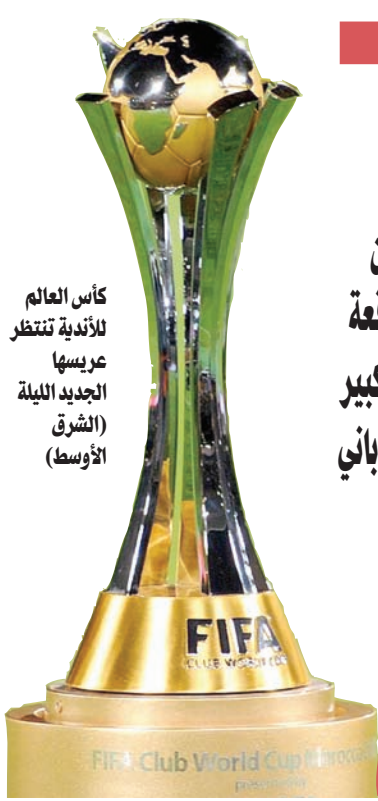
كأس العالم للأندية تنتظر عريستها الجديدة الليلة

وهيمنت فرق القارة القديمة على المسابقة العالمية للأندية، حيث لم تخسر في آخر 21 مباراة، وتحديداً منذ عام 2012. ويعد ريال مدريد أكثر الفرق تتويجاً باللقب، الذي أحرزه 5 مرات (2014 و2016 و2017 و2018 و2022) يليه برشلونة 3 مرات، وكورنثيانز، وبايرن ميونخ بالتساوي مرتين. وفي حين يبدو سيتي مرشحاً فوق العادة للظفر باللقب، أثنى