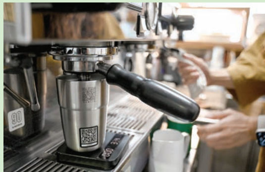
الاستغناء عن البلاستيك مطلوب رغم صعوبة إيجاد بدائل

وكان وزير البيئة الكندي ستيفن غيلبو قال إن «المعطيات العلمية واضحة: التلوث البلاستيكي منتشر في كل مكان، ويسبب أضراراً للحياة البرية والبيئة».