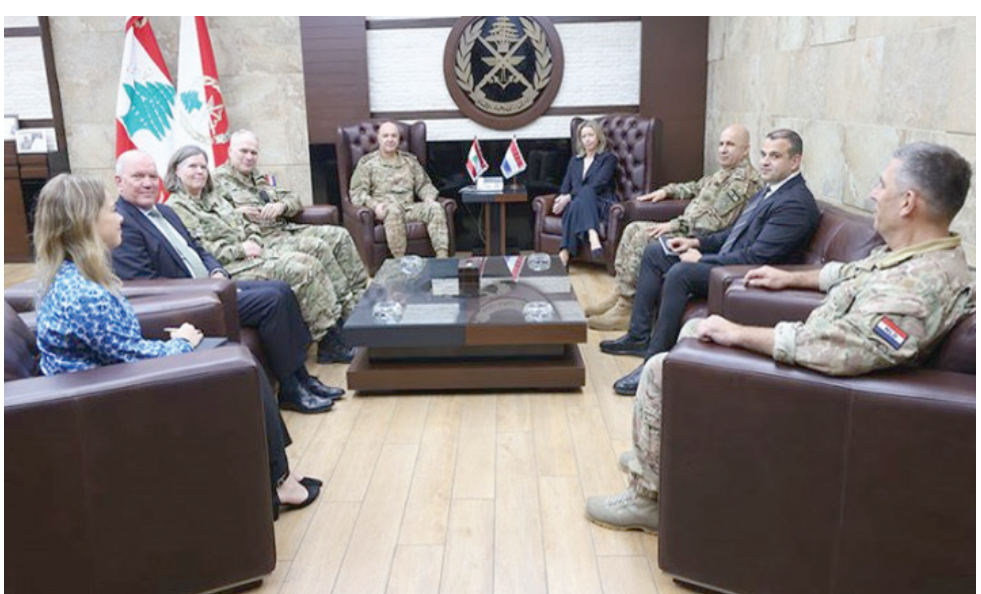
قائد الجيش اللبناني العماد جوزف عون مستقبلاً وزيرة الدفاع الهولندية ورئيس الأركان والوفد المرافق

لا تبدو حظوظ باسيل بإسقاط قانون التمديد بطعن سيستفيد به أمام المجلس الدستوري كبيرة. ويُقر أحد نواب «الوطني الحر» بذلك، قائلاً لـ«الشرق الأوسط»: «قد لا تكون احتمالات القبول بالطعن كبيرة إلا أن هناك مساراً سلكتاه بدستوراً نحاول الحفاظ عليه فيما يُعمن الآخرون بخرقه مراراً وتكراراً»، مضيفاً: «قانون التمديد الذي يعلم الجميع أنه يستهدف شخصاً واحداً مخالف للدستور، وكمنتمنى على المجلس الدستوري أن يترفع عن كل الضغوط ويأخذ بالطعن». واجمعت معظم الكتل السياسية