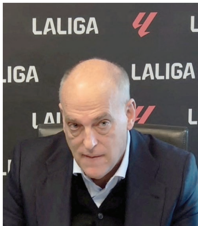
تيباس رئيس رابطة الدوري الإسباني في مؤتمر صحفي عقب صدور القرار

وتضمن الاقتراح أن يلعب كل فريق 14 مباراة قبل مراحل خروج المغلوب. وأعلنت «أي 22» أيضاً، أنها