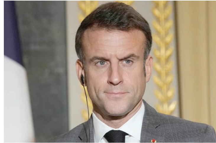
الرئيس الفرنسي إيمانويل ماكرون

يضاف إلى ذلك أن لبنان ما زال من غير رئيس للجمهورية، وأن زيارة ماكرون يفترض أن تقضي إلى تحقيق شيء بهذا الصدد، في حين تزداد المخاوف ومعها التحذيرات من خروج المناوشات اليومية