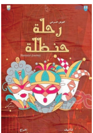
بوستر العرض (المخرج)

وفق النص الأصلي، عن شخصية سلبية غير محددة الجنسية تعيش على الهامش، هي شخصية «حنظلة» الذي يعمل ممثلاً ثانوياً بفرقة مسرحية. ورغم أنه يفضل الابتعاد عن المشكلات ويحرص على تجنب المتاعب ويقضى معظم الوقت في قراءة الكتب وكأنه يهرب من العالم، فإن المصائب تتوالى على رأسه حيث تخونه زوجته، ويجد نفسه متهماً في قضية خطيرة لا يعلم عنها شيئاً. يتمكن «حنظلة» من رشوة أحد القضاة ويخرج من السجن حيث الحرية المقترضة، لكنه يتكشف أن العالم الخارجي لا يقل سوءاً عما تركه وراءه في الزنزانة. يدرك الرجل أن تغيير حياته لن يأتي من الخارج وإنما وفق إرادته الشخصية حين تتغير نظرتة إلى العالم وإلى ذاته. وتضمنت المعالجة المصرية الجديدة التي قدمها أشرف على بعض التغييرات في الحكمة، أبرزها جعل