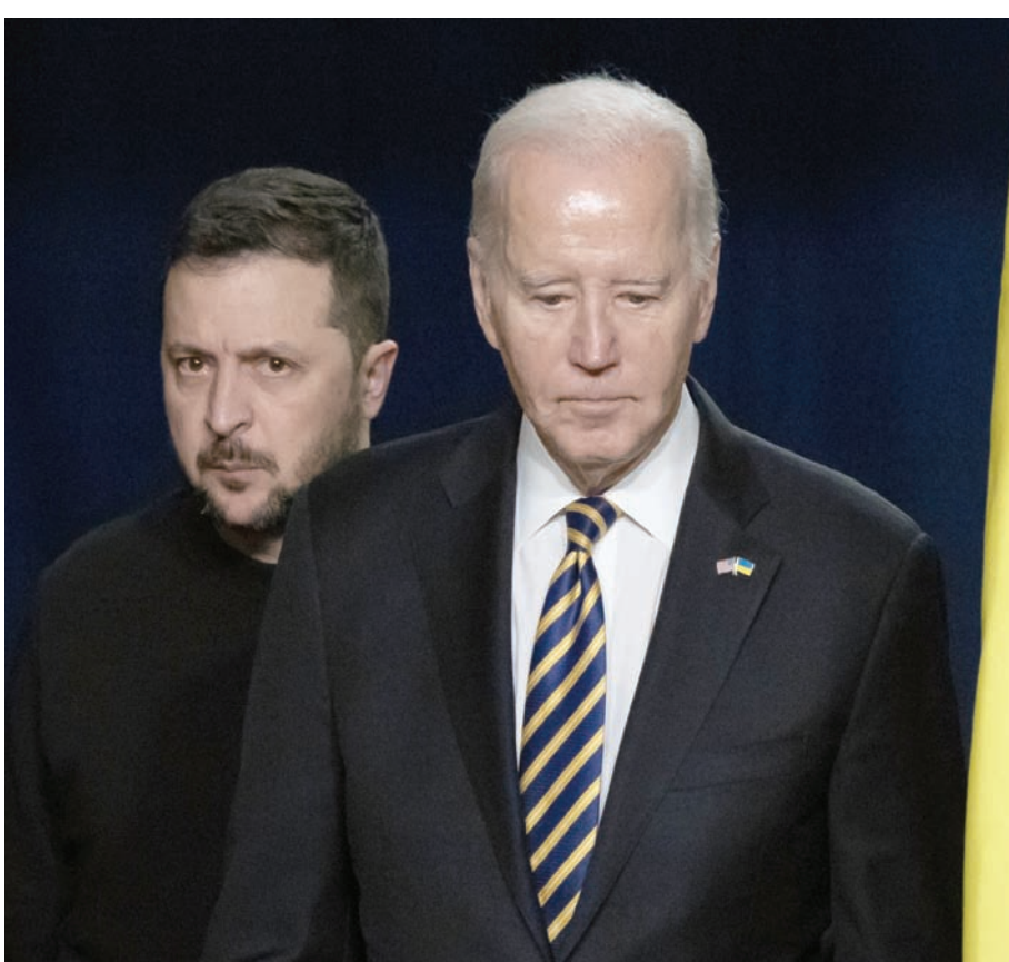
بايدن وزيلينسكي في أحد لقاءاتهما

و بحلول 2022، كانوا قد شعروا بثقة كافية لتوجيه كل قوات بلادهم البرية المحترفة لغزو أوكرانيا، لينكبوا خسائر فادحة لأنفسهم، فيما أصبح سوء تقدير، له أبعاد تاريخية. وحذّرت ماسيكوت من أن تداعيات تخلي الغرب عن كيف ستجاوز أوكرانيا، وتزايدت المخاطر من أن الكرملين قد يستنخ قريباً أنه تفوق على أوكرانيا، ورأى حدود الإرادة السياسية للغرب ورغبته في دعم حرب طويلة. وإذا حدث هذا، فقد يخلص بوتين إلى أنه تم اختبار الاستخبارات المجمعّة للغرب وتخطيطه العسكري وأسلحته وتكتيكاته وإنتاجه الدفاعي، وأنه فشل في تحويل اتجاه الحرب في النهاية. وتضيف أنه إذا كان الكرملين يعتقد أن أساليب القوة الغاشمة