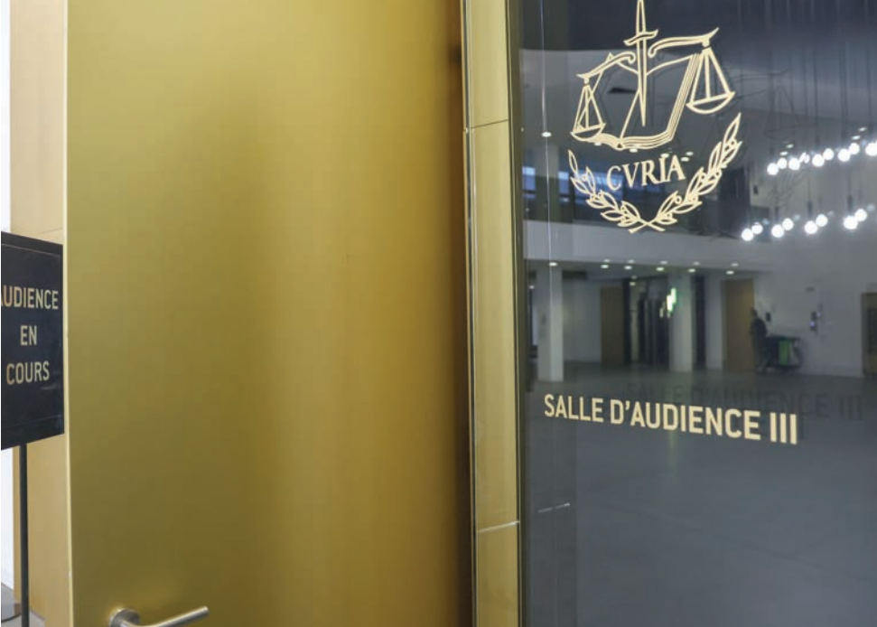
محكمة العدل الأوروبية في لوكسمبورغ أكدت أن «فيفا» و«يويفا» انتهكا قانون الاتحاد الأوروبي للعبة

في اقتراح وتعزيز المسابقات الأوروبية التي تعمل على تحديث كرة القدم.