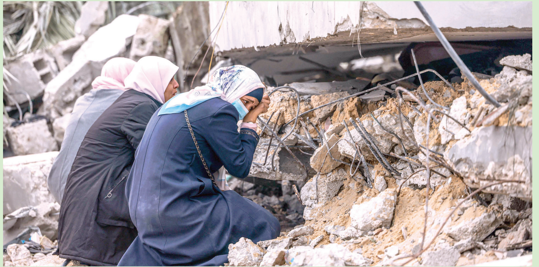
نساء يبكين قريبا لهن يبدو أنه عالق وسط الركام بعد غارة إسرائيلية على رفح بجنوب قطاع غزة أمس (أ.ف.ب)