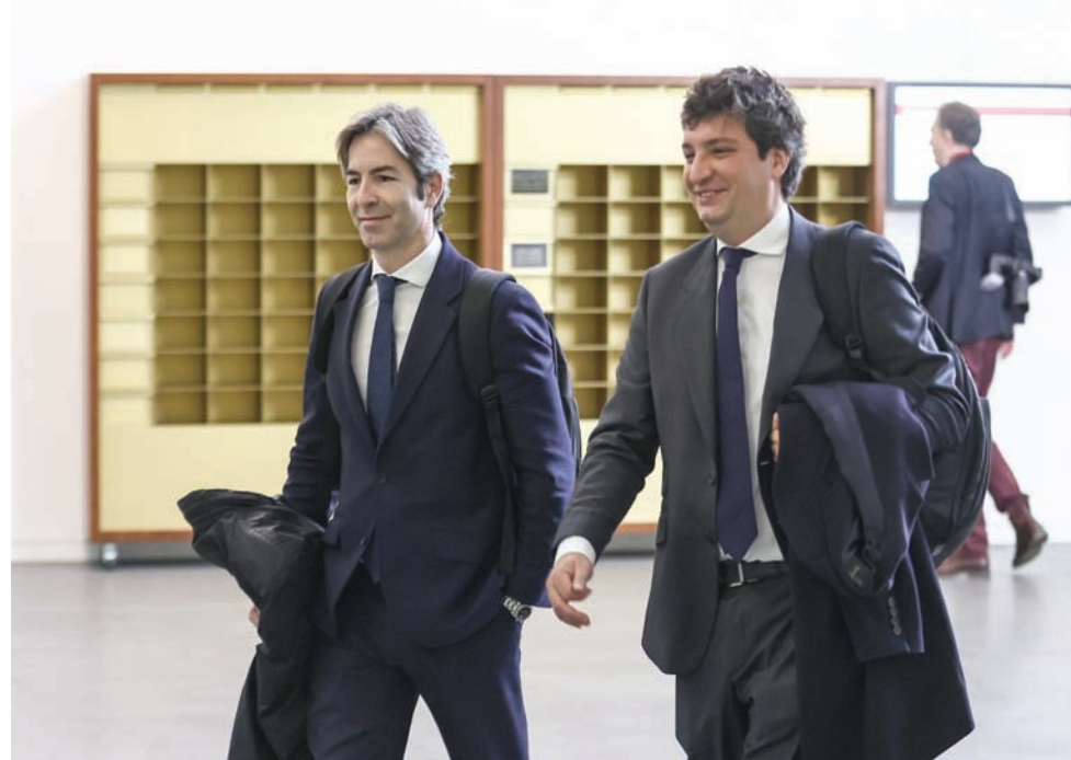
محاميان يمثلان مؤيدي الدوري السوبر في طريقهما لقاعة المحكمة

وأعلن 12 نادياً من العيار الثقيل في أبريل (نيسان) 2021 إطلاق الدوري السوبر المغلق مع إمكاناته التجارية الهائلة؛ وذلك تزامناً مع