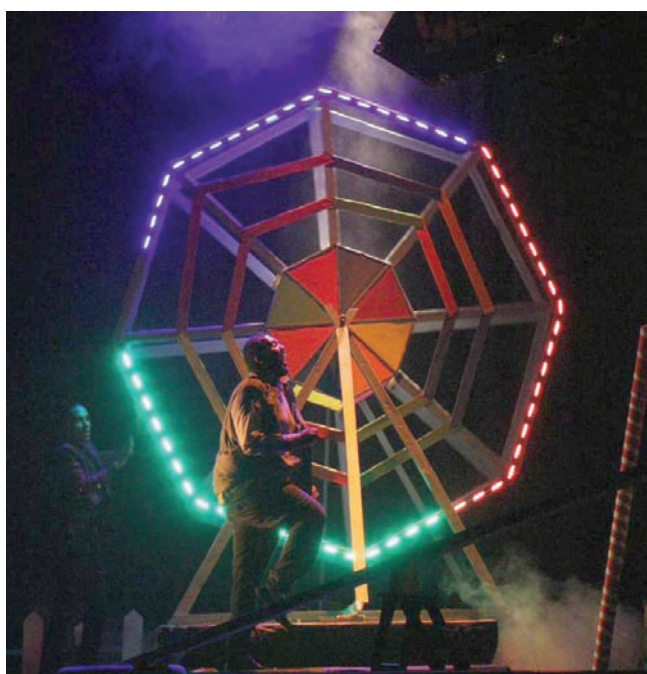
ألعاب الملاهي تشكل فضاء مسرحياً (المخرج)

معالجة مصرية جديدة لمسرحية سعد الله ونوس