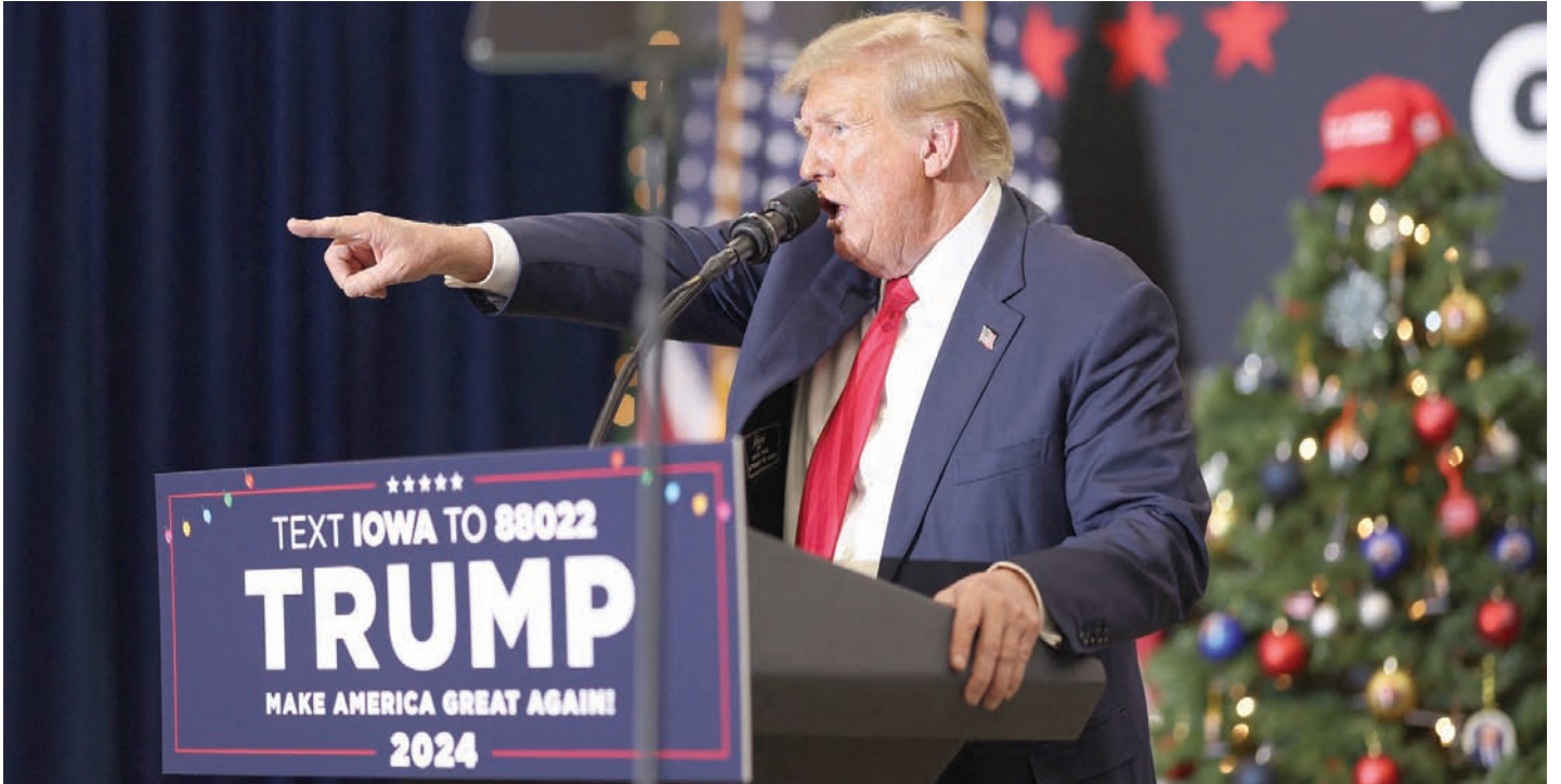
ترمب في تجمع انتخابي في أيوا الثلاثاء الماضي