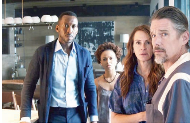
«ترك العالم خلفك» (نتفليكس)

والمنتج ستيفن سبيلبرغ فيلماً مأخوذاً عن ذكريات وضعتها اليس وكر في كتاب عنوانه «اللون الأرجواني» تحدّث فيه عن مشاق حياتها ومحاولتها البحث عن خلاص من وضع جائر سببه سوء معاملة زوجها لها وإحباطات نفسية أخرى. فيلم سبيلبرغ كان استعظافياً بدا فيه المخرج كما لو أنه يريد التأكيد على ليجربيته وشعوره الإيجابي حيال مأساة المرأة الأفرو - أميركية.