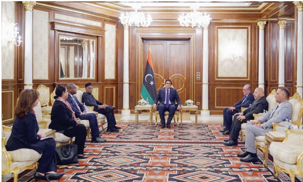
المنفي مستقبلاً باتيلي في مكتبه بطرابلس (المجلس الرئاسي)

انفتح عام 2023 على موجة تفاؤل واسعة بين عموم الليبيين الذين كانوا ياملون في كسر حالة الجمود السياسي وتحقيق ما فاتهم من فرصة إجراء الانتخابات، وتوحيد