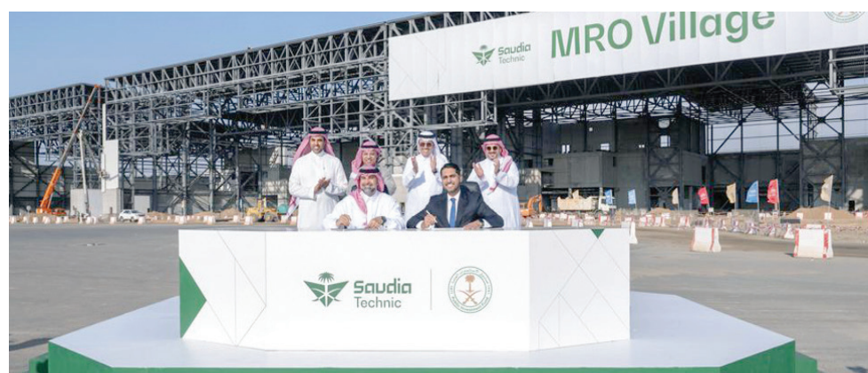
جانب من توقيع الاتفاقية بين الجانبين (الشرق الأوسط)

بهدف تطوير خدمات صيانة وإصلاح وتجديد الطائرات على مستوى المملكة