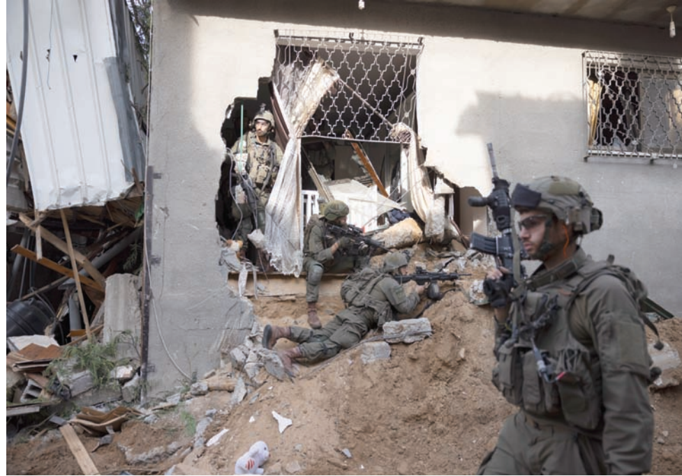
جنود إسرائيليون في عملية برية بحى الشجاعية في غزة

على الأرض، أعلن الجيش الإسرائيلي، في ذي حشر 137 عنصراً منذ بدء عملياته البرية في 27 أكتوبر في قطاع غزة، أن جنوداً إسرائيليين عبروا على أسلحة في مدرسة بمدينة غزة. وتعرضت، أمس، مدينة خان يونس، أكبر مدن جنوب قطاع غزة، لقصف عنيف، ودوت صفارات الإنذار في جنوب إسرائيل وفي تل أبيب (وسط)، جراء إطلاق صواريخ اعتراضتها الدفاع الجوية الإسرائيلية. وأفادت الشرطة بحصول أضرار دون تسجيل