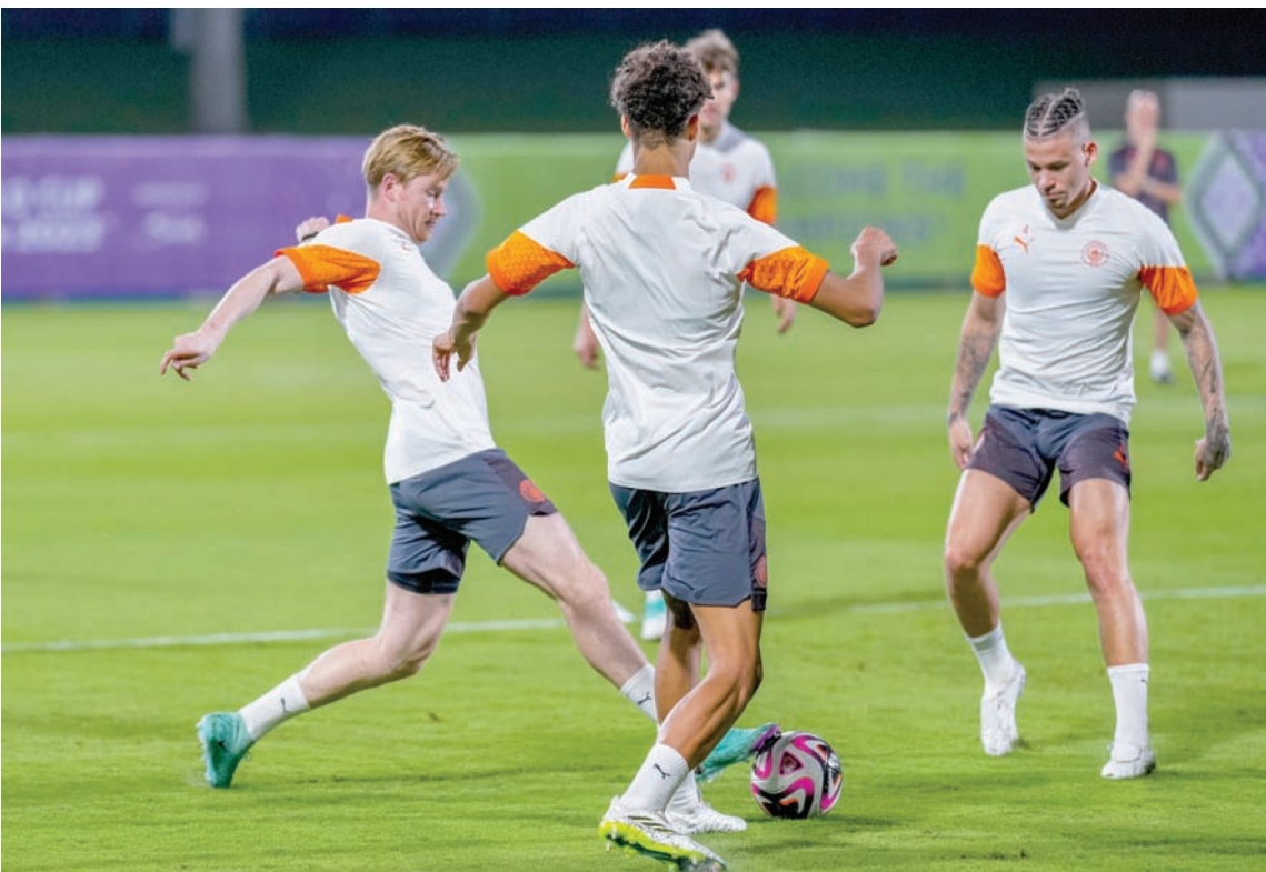
من تدريبات مان سيتي تأهباً للنهائي