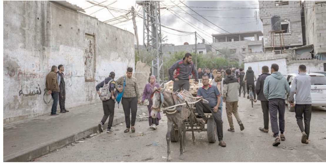
الدخان يتصاعد بعد قصف إسرائيلي على رفح جنوب قطاع غزة

بعد شهرين من الزيارة التي قام بها إلى المنطقة، التي قادته إلى إسرائيل والضفة الغربية والأردن ومصر، وذلك بعد 3 أسابيع من العملية العسكرية الواسعة التي قامت بها «حماس» في محيط قطاع غزة، وانطلاق الحرب الإسرائيلية على القطاع، يعود الرئيس الفرنسي إيمانويل ماكرون، (الخميس)، مجدداً إلى المنطقة وتحديداً إلى الأردن، ولكن هذه المرة في إطار الزيارات التقليدية التي يقوم بها إلى القوات الفرنسية المنتشرة في الخارج، بمناسبة أعياد رأس السنة. ويغادر الأردن الجمعة عادداً إلى فرنسا بعد أن يكون قد التقى، العاهل الأردني الملك عبد الله الثاني.