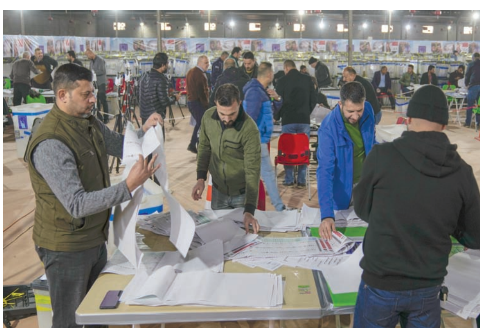
عشرات الموظفين يعملون على فرز صناديق انتخابية في مقر المفوضية ببغداد

وتتقرب الكتل الفائزة حسم الطعون والشكاوى والتصديق على النتائج لئلا تبدأ تحالفاتها رسمياً لاختيار رئيس المجلس والمحافظة. لكن هذا الوقت لن يطول كثيراً، خصوصاً أن مفوضية الانتخابات لم تتلقَ شكاوى «حمرآة» يمكنها التأثير كثيراً على النتائج.