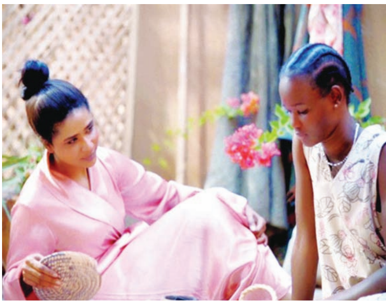
«وداعاً جوليا» (ستايشن فيلمز)

تبقى مسألة اتكال بعض الدول العربية على الإنتاجات الأوروبية معضلة مستمرة كما كان حالها في السنوات السابقة. علمياً وينتمي الفيلم للمخرج إلا في حال ذكر من «وكواليس» لعفاف بن محمود وخليل بن كيران. أما السينما المغربية التي هي أكثر نشاطاً، فإن بعض أهم أعمالها للعام