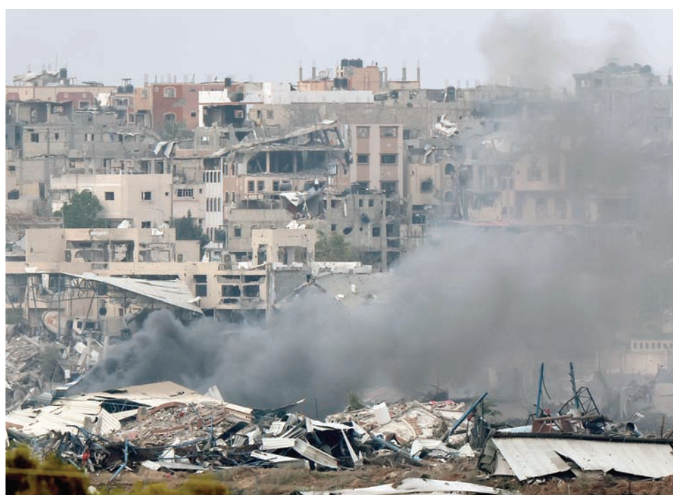
صورة تم التقاطها بالقرب من الحدود مع قطاع غزة تظهر الدخان يتصاعد وسط الدمار في شمال غزة

ويربط المراقبون بين هذا الموقف، وبين تصرف نتنياهو الأب الذي استمع إلى وزيرائه، إيتمار بن غفير، وميري ريجف، ودودي عماسلم، وهم يهاجمون هليفي والجيش خلال جلسة المجلس الوزاري الأمني المصغر يوم الإثنين، ويتهمانه بالاستمرار في قصور 7 أكتوبر خلال الأداء الفاشل للحرب، بينما ظل نتنياهو صامتاً. ويقول المطلعون على بواطن الأمور إن نتنياهو انتقل بذلك إلى