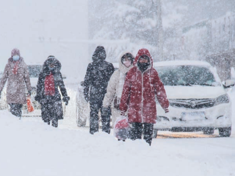
مجموعة من الأشخاص يسرون وسط هطول كثيف للثلوج في إحدى مدن شرق الصين

وقالت المجموعة التي تملك 24,99 في المائة من الأسهم حتى الآن في حقل يوجنو روسكوي، في بيان: «تقوم شركة (أو إم في) حالياً بدراس الوقائع حفاظاً على حقوقها». ورداً