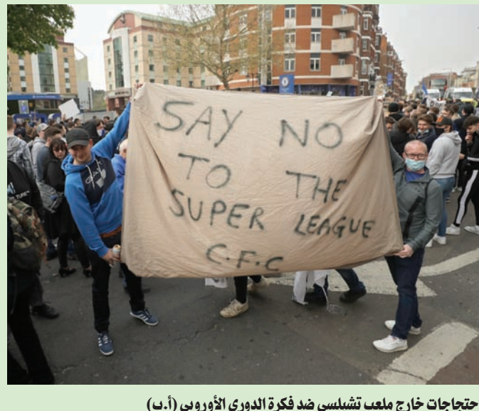
احتجاجات خارج ملعب تشيلسي ضد فكرة الدوري الأوروبي (أ.ب)

كييف - موسكو: «الشرق الأوسط» بعد تعثر هجومها المضاد، وإقرارها بتحقيق روسيا مكاسب ميدانية في جبهات القتال، بدأت أوكرانيا تبحث عن جنود إضافيين ترغ بهم في أرض المعركة التي بدأت تقترب من نهاية عامها الثاني. ويرغب الجيش الأوكراني في تعبئة ما بين 450 ألفاً إلى 500 ألف جندي إضافي لصند القوات الروسية. وقال الكولونيل ألكسندر شتوبون، بانضمام الرجال الذين يعيشون في الخارج، لأداء الخدمة العسكرية، العام المقبل. وقال أميروف إنه سيطلب من الأوكرانيين، الذين تتراوح أعمارهم بين 60 و25 عاماً في ألمانيا ودول أخرى والمؤهلين لأداء الخدمة العسكرية،