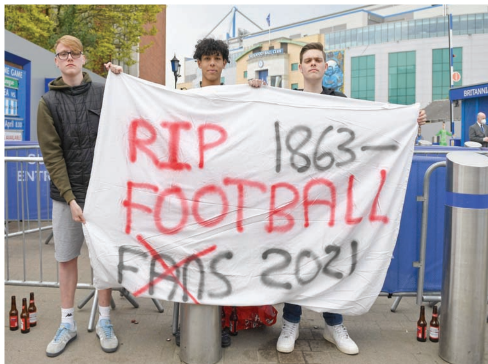
الدوري الانشقاقي قسم مجتمع كرة القدم في أوروبا (أ.ب.أ)

وقالت: «اختصار، نجح عالم كرة القدم في تجاوز مشروع دوري السوبر الأوروبي منذ سنوات عدة من خلال إجراء الإصلاحات اللازمة، مع عزمه مواصلة هذه