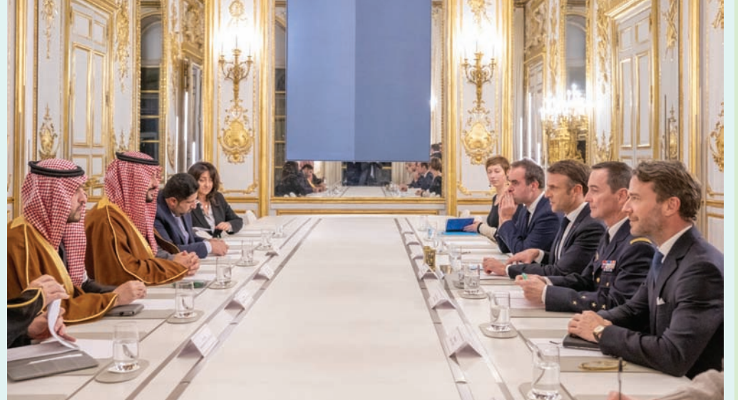
من جلسة المباحثات السعودية - الفرنسية