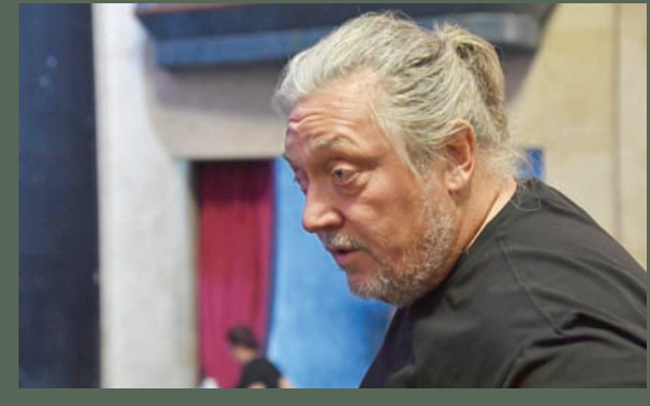
فيديانسي يرفض نسب المسؤولية لشخص واحد (إم تي إي)

ونقلت وكالة الأنباء الألمانية عنه قوله لصحيفة «ساجيار نيمزيت» الموالية للحكومة في تصريحات الخميس: «لا يمكن نسب المسؤولية لشخص واحد».