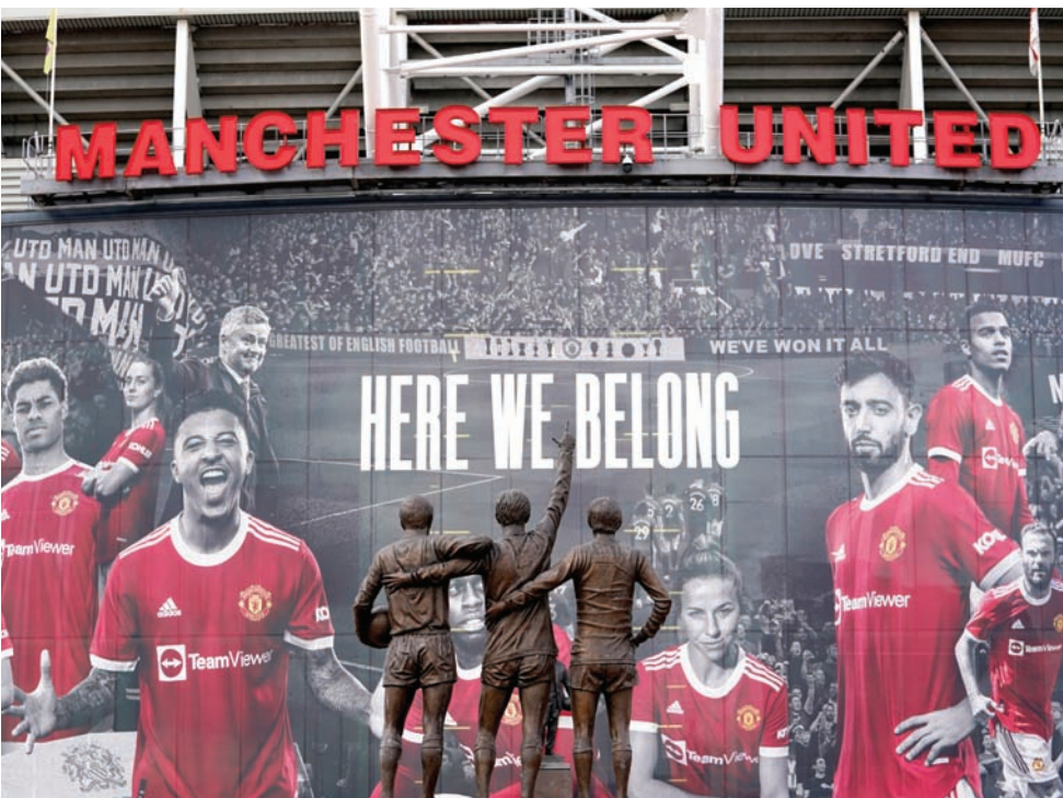
مانشستر يونايتد أكد التزامه بالبطولات التابعة لـ«يويفا»، والدوري الإنجليزي

يأتي ذلك في وقت أكد فيه نادي مانشستر يونايتد الإنجليزي أنه ملتزم بالبطولات التابعة للاتحاد الأوروبي لكرة القدم (يويفا) والدوري الإنجليزي الممتاز، رغم قرار محكمة العدل الأوروبية. وأعلنت أندية مانشستر سيتي ومانشستر يونايتد وليفربول وارسنال وتشيلسي وتوتنهام وميلان وإنتر ميلان ويوفنتوس