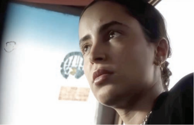
من «نافة» (نتفليكس)

الممتدة ويشهدان بعض الشغب قبل أن ينطلقا مجدداً بالسيارة. يتوقفان عند سيارة لبيع المتلجات، ويشاهدان سوء معاملة شلة من الرجال للعامل المسكين. سارة تريد العودة إلى البيت تلافياً للتأخر عن موعد الالتزام بالبيت؛ هي تعيش في عائلة محافظة والأب لا يسمح لابنته بالبقاء خارج البيت لما بعد ساعة معينة، لكن سعد (الذي يبدأ المشاهد بالمشك في ماريه) يصنّ على استكمال الرحلة خلال مشادة على الطريق، حين يصطدم في عتمة الليل بفاقة وليدة عن غير عمد. يكملان الطريق إلى مضرب من الخيام حيث المخدرات مباحة وأنواع اللهو الأخرى. تصنّ سارة على العودة، ولو منفردة، والطريق محفوفة بالمخاطر. لب الفيلم محاولتها العودة وحيدة ليلاً ومن دون هاتك يعمل.