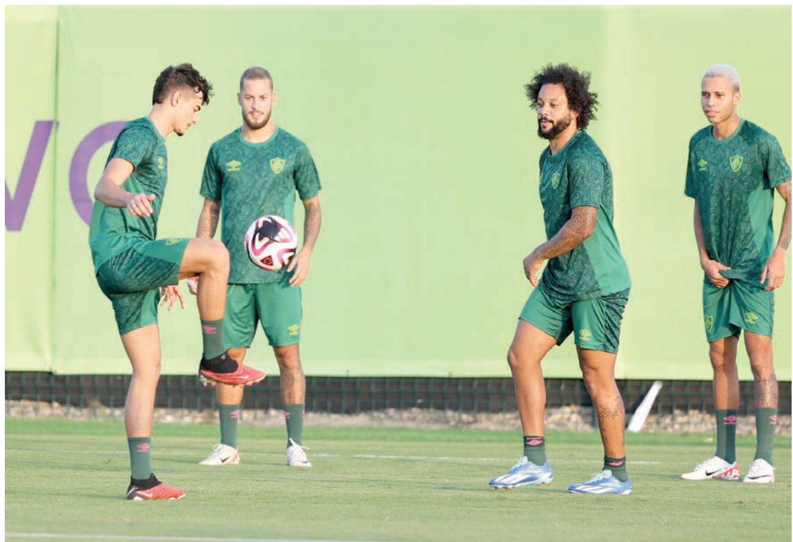
جانب من استعدادات فلومينينسي البرازيلي

مارسيلو على الفريق الإنجليزي، قائلاً: «إنهم في الوقت الحالي أحد أفضل الفرق في العالم. لديهم عديد من اللاعبين المميزين، ومدرب رائع. ليس هذا العام فقط، بل منذ سنوات عدة، إذ قدموا أداءً رائعاً في الدوري ومسابقات دوري أبطال أوروبا».