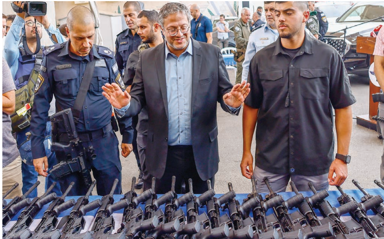
بن غفير يتفقد بنادق آلية قبل تسليمها لمتطوعين في عسقلان في أعقاب هجوم حماس في 7 أكتوبر الماضي

كل مكان، بما في ذلك اليوم. كما أننا نهاجم معاونهم القريبين والبعيدين. مصغر يضم الجبرائيل السابقين (يواف غالانت وبيني غانتس وغادي إيزنكوت)، وإعادة الصلاحيات للمجلس بأكمله أعضائها. وادعى بأن وزير المالية بسلسل سموتريتش، لا يكتفي بذلك، وهما يطالبان نتنياهو