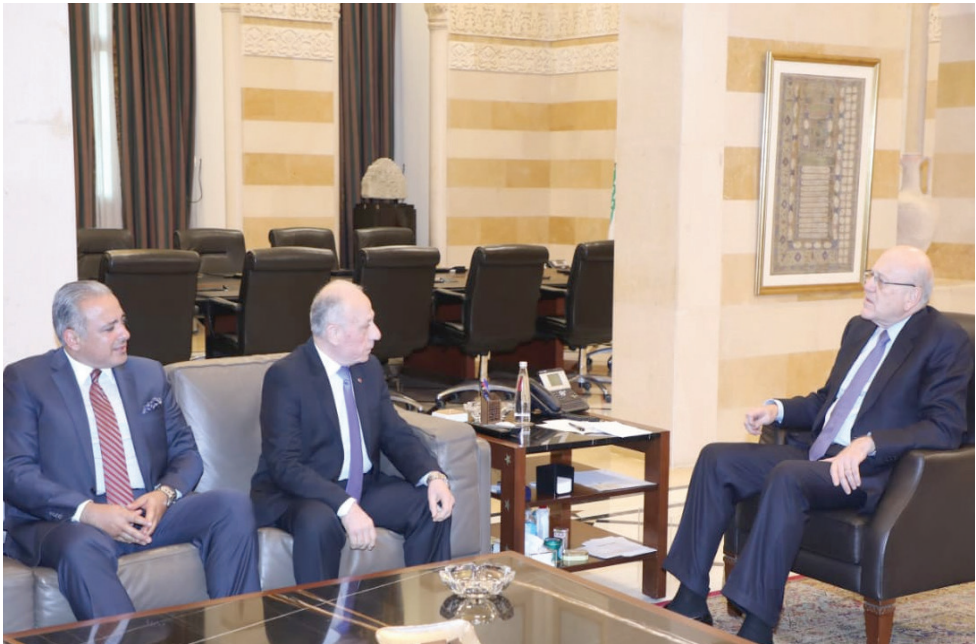
الرئيس ميقاتي مجتمعاً مع الوزيرين سليم ومرضى

عندما يطرح موضوعه يطرح بشكل متطور بالنسبة لحالة الشغور في المؤسسات العسكرية، وهذا موضوع كنت بادرت لمعالجته منذ أكثر من ثلاثة أشهر ولكن مرت أمور عديدة، جعلت الظروف لا تسمح باكمال هذه الأمور». وقال رداً على سؤال بان هذا الموضوع «لا يزال قيد التداول والنقاش وكل الحلول لن تكون إلا وفقاً لل دستور وقانون الدفاع الوطني». وعن تعيين رئيس الأركان والمجلس العسكري قال الرئيس ميقاتي: «حاولت في كل هذه المرحلة جاهداً أن أكون بعيداً عن أي سجل إعلامي، ولا أريد أن ادخل بأي سجل حول هذا الموضوع لأن العبر هي في خواتمها والخواتم لغاية الآن جيدة، وسأظل على مديني بعدم الدخول في أي سجل إعلامي مع أحد على رغم كل ما يقال. ولقد قلت وأكرر بان هناك أمراً يتعلق بصلاحيات رئيس الوزراء ومقامه ولا أقبل أن يتعرض أحد له بأي شكل من الأشكال».