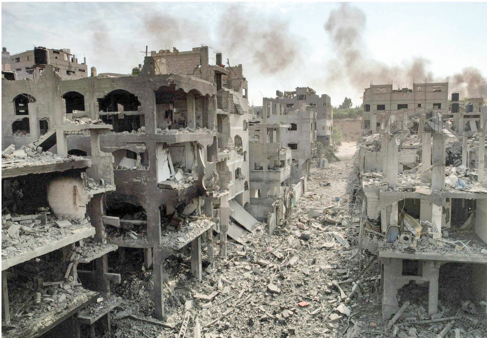
جانب من آثار الدمار الذي خلفته الغارات الإسرائيلية في مدينة غزة

وبذلك كان الرئيس الفرنسي يرد على الانتقادات التي تعرّض لها، ليس فقط في الإعلام ولكن أيضاً من داخل المؤسسة الدبلوماسية ومن غالبية السفراء العاملين في الدول العربية الذين يرون أن مواقفه «منحازة لإسرائيل». ويوم (الأربعاء)، خصصت صحيفة «لو سوند» المستقلة موضوعاً مطولاً فنّدت فيه المواقف الرئاسية، والنمائي إلى حد كبير مع السياسة الإسرائيلية، والهوة التي قامت بين الإلتهريه من جهة ووزارة الخارجية الفرنسية من جهة أخرى، وفقدان فرنسا مصداقيتها لدى العرب بسبب تحيزها. وبين الحين والآخر، تخرج تصريحات تعكس الرغبة في تصحيح المسار الدبلوماسي.