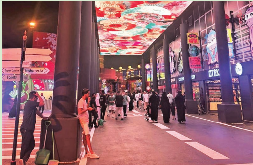
جانب من المتاجر المنتشرة في أنحاء المنطقة الترفيهية (الشرق الأوسط)

كما اشتملت المنطقة الترفيهية الجديدة على عدد من المناطق المختلفة، ومنها تجربة الرعب في جامعة هونغ كونغ، وحديقة «الساكورا اليابانية»، والأخرة بالجمال الطبيعي والاكتشافات الثقافية، حيث تقدم