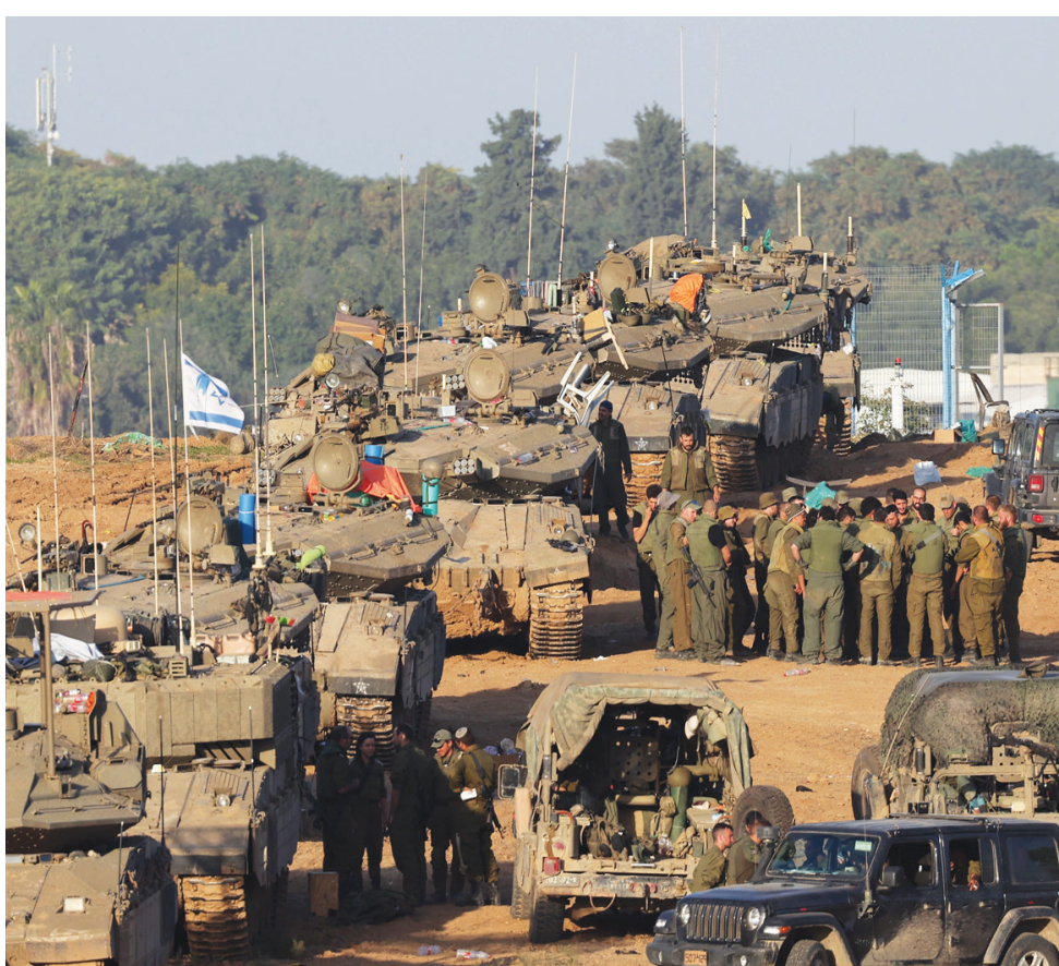
جنود إسرائيليون يتجمعون قرب دباباتهم في موقع مُعدّ للحدود مع قطاع غزة جنوباً يوم السبت

وحتى في صحيفة اليمين الإسرائيلي، المناصرة لرئيس الوزراء، بنيامين نتانياهو، دعوة للحذر من السقف العالي للأهداف. ويكتب البروفيسور أبال زيسر أنه «من الأفضل أن نقول القيادة للجمهور الحقيقية، ما هو الممكن وما هو غير الممكن أن تحققه في عملية عسكرية، نظراً للظروف الدولية والأضرار الاقتصادية والأمنية».