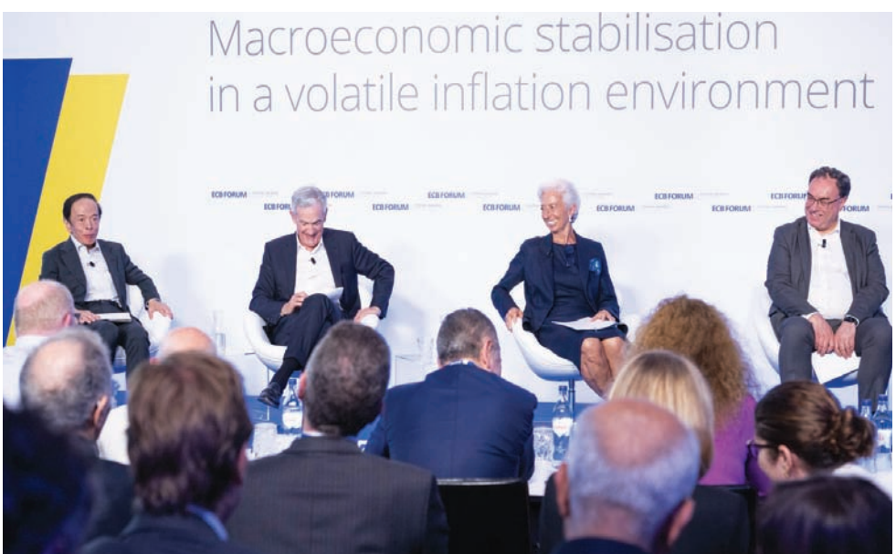
(من يمين الصورة) بابلي ولاغارد وباول ومحافظ المصرف المركزي الياباني كارو أويدا (موقع لاغارد على اليسار)

على مدته». لكن صناع السياسات النقدية الآخرين يتراجعون. وقال رئيس المصرف المركزي الألماني يواكيم ناغل، إن الانخفاض «المشجع» في التضخم الأسبوع الماضي، لم يكن كافياً لاستبعاد احتمال أن تكاليف الاقتراض قد تحتاج إلى الارتفاع. كما حذر من أنه «من السابق لأوانه مجرد التفكير في احتمال خفض أسعار الفائدة الرئيسية».