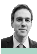
بريت ستيفنز *

مثل هذه المواقف المنحّزة لها عواقبها. كتبت سوزي لينفيلد، أستاذة الصحافة في جامعة نيويورك، في مقال مهم نشرته مؤخراً مجلة «كوبليت» على الإنترنت: «إن اليسار الذي يطالب عن حق بالإدانة المطلقة للتفوق القومي الأبيض، يرفض أن ينأى بنفسه عن التفوق الإسلامي. وإن اليسار الذي يتشدد بالتقاطعية مع مختلف الأطراف لم يلاحظ أن محور دعم (حماس) يتألف من إيران، التي اشتهرت مؤخراً بقتل مئات المتظاهرين المطالبين بحرية المرأة» من ناحية أخرى، تعزز هذه المبادئ القناعات المركزية والمخاوف العميقة لليمين الإسرائيلي؛ أن الفلسطينيين لم يتصالحوا أبداً مع وجود إسرائيل على أي حدود، وأن كل تنازل إقليمي ودبلوماسي إسرائيلي يعدّه الفلسطينيون دليلاً على الضعف، وأن قيام دولة فلسطينية في قطاع غزة وال الضفة الغربية لن يكون سوى منحة من إسرائيل.