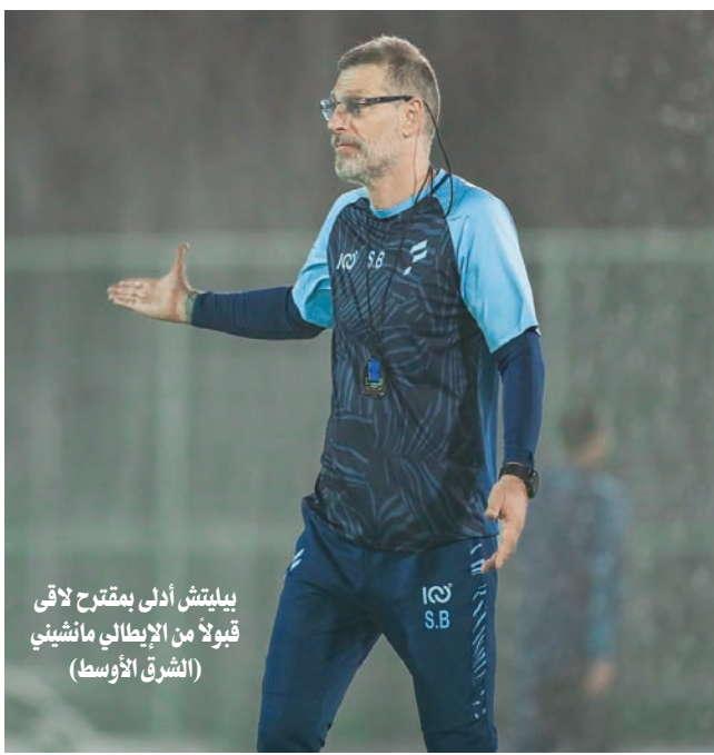
بيليتش أدلى بمقترح لاقى قبولا من الإيطالي مانشيني (الشرق الأوسط)

وشهد دوري روشن السعودي إبرام عدد من الصفقات العالمية في الصيف الماضي، وهو ما أسهم في زيادة القيمة السوقية للمسابقة لأكثر من مليار يورو.