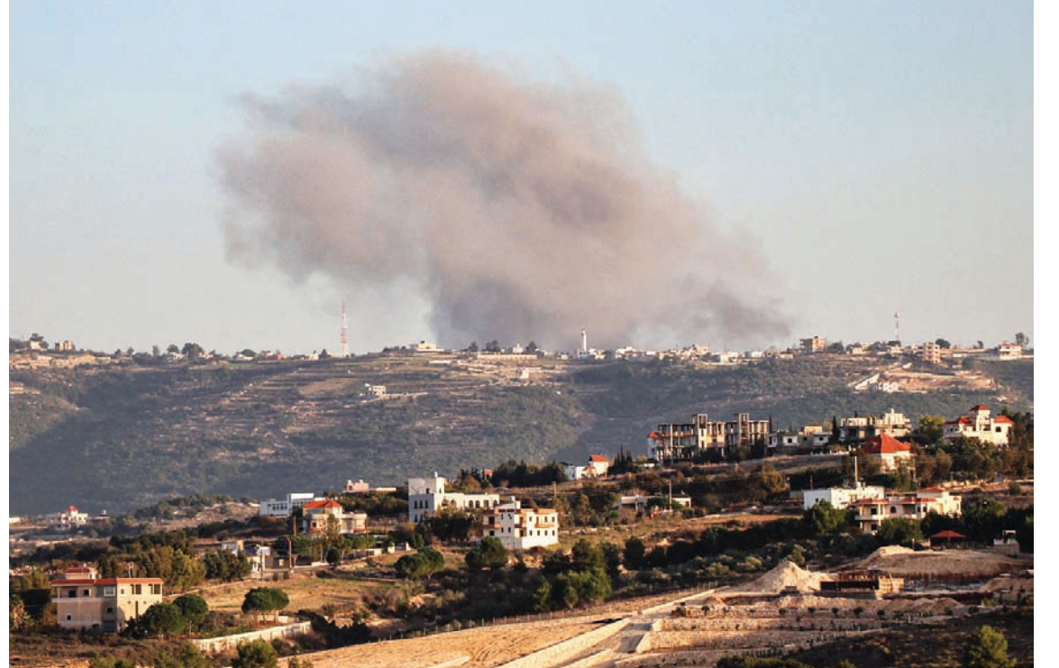
الدخان يتصاعد من مناطق لبنانية استهدفتها القصف الإسرائيلي أمس

وفي القطاع الغربي، المحاذي للساحل اللبناني، تعرضت منطقة اللبونة في الناقورة لقصف مدفعي من عيار 155 ملم، كما استهدف الجيش الإسرائيلي بقذيفتين منزلًا في أطراف بلدة مروحين مقابل مقر الكتبية الغانية، وكان المنزل نفسه قد تعرّض للقصف مرات عدة سابقاً، في حين سقطت قذيفة في الحرج، بين القوزح وبيت ليف. كما طال القصف الإسرائيلي أطراف بلدات الناقورة وعنتا الشعب ورامية ومروحين. وأفادت الوكالة الوطنية بأن طائرة مسيرة إسرائيلية نذت غارة جوية، حيث استهدفت بصاروخ موجه الأطراف الشمالية الشرقية لبلدة عنتا الشعب، وعصراً، تعرضت أطراف بلدات اللبونة، ومروحين، وشيحين، كثيف، كما تعرّض تل نحاس لقصف مدفعي عنيف.