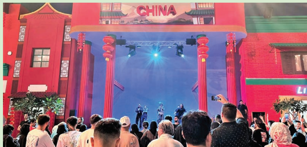
حضور كبير شهده افتتاح المنطقة الترفيهية في جدة

فرصة للانغماس في عالم هادئ وشاعري، وصولاً إلى الألعاب الحركية والترفيهية بمنطقة تابلون فليج، والتجربة الحية لـ«الفلة الآسيوية» التي ينتظر أن تدشن، الأيام القليلة المقبلة، في المنطقة لتجارب ترفيهية متنوعة وفريدة.