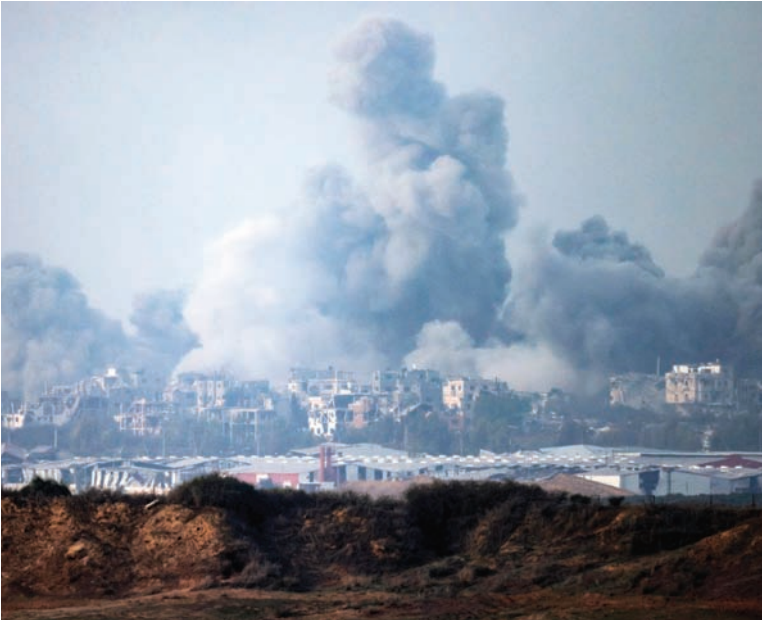
صورة من جنوب إسرائيل تظهر حجم الدخان المتصاعد فوق غزة أثناء القصف الإسرائيلي أمس (أ.ف.ب)