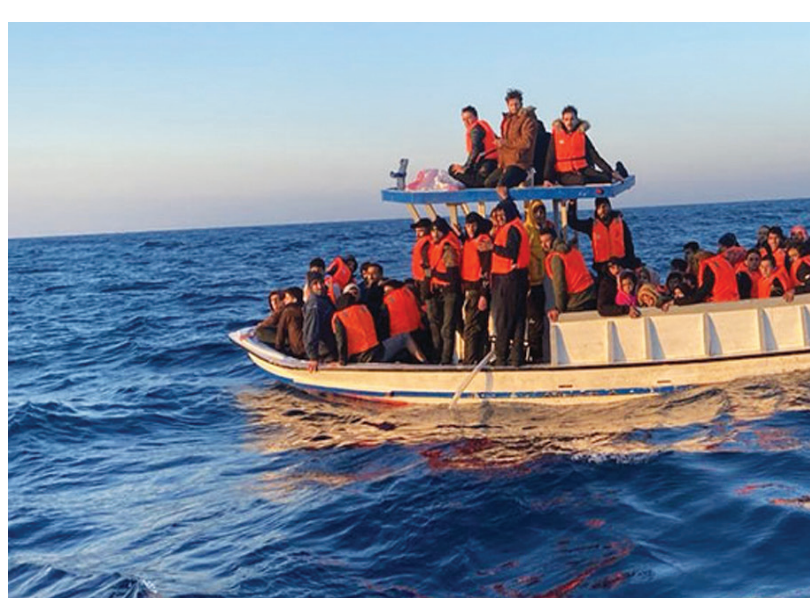
قارب يحمل مهاجرين غير شرعيين من لبنان إلى أوروبا