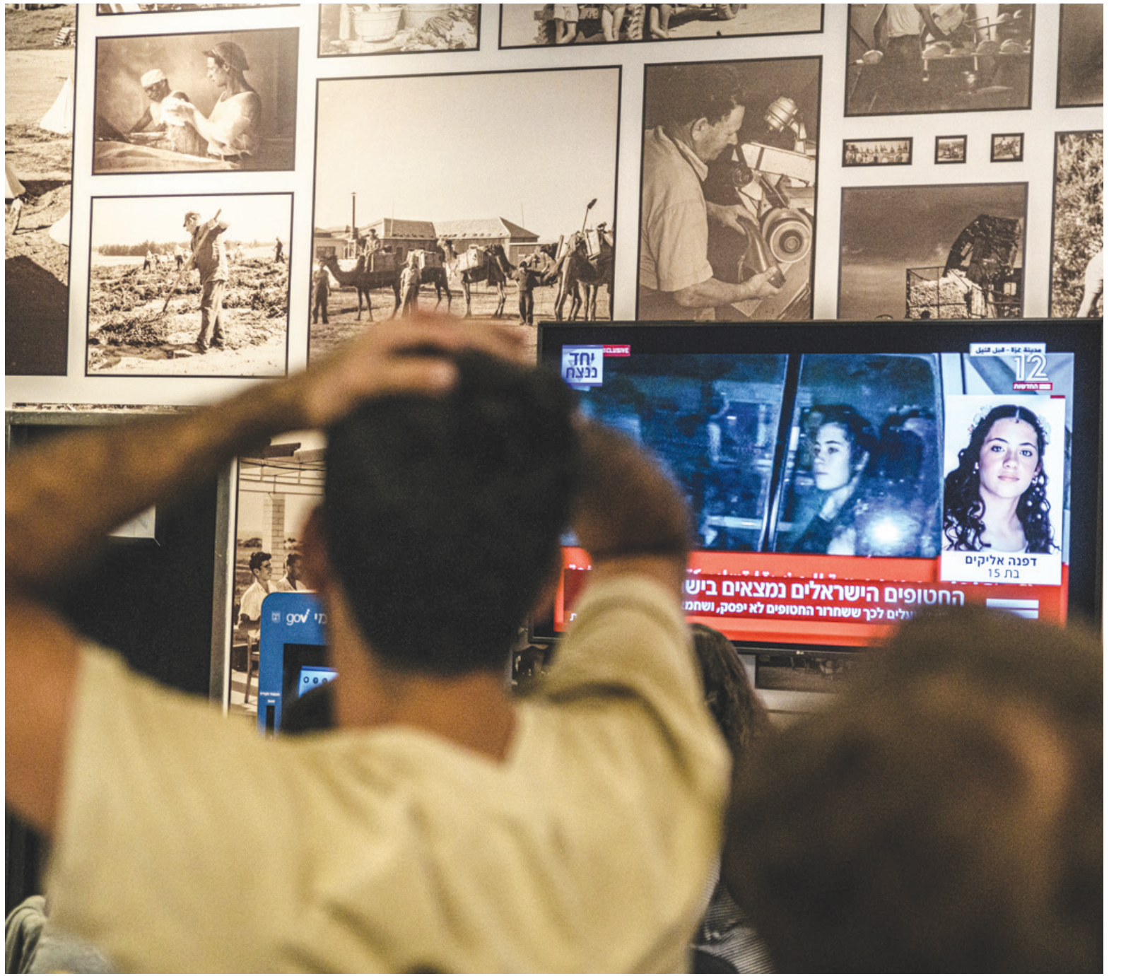
أفراد من كيبوتس كفار عزة يتابعون إطلاق سراح نساء وأطفال من أسر «حماس» 26 نوفمبر (د.ب.أ)