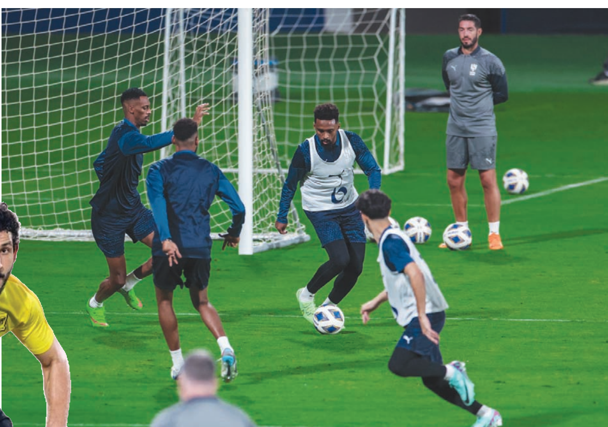
من تدريبات الهلال الأخيرة (نادي الهلال)

وفي مواجهة تحصيلية في المجموعة الثالثة ذاتها، يستضيف القوة الجوية العراقي نظيره أجمك الأوزبكي لتحقيق فوز معنوي قبل نهاية مشاركة الفريقين في البطولة، خصوصاً بعد خسارة الفريق العراقي الجولة الماضية أمام الناهل عقب تعثره أمام سيهاهان الإيراني.