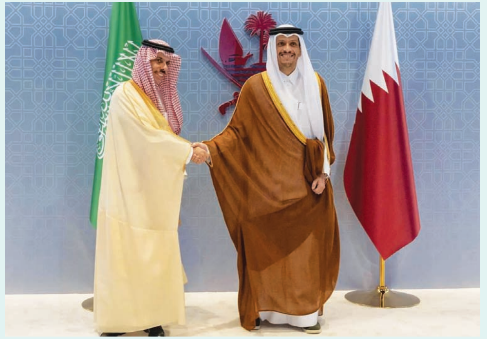
وزيرا الخارجية السعودي والقطري خلال أعمال الاجتماع الأول للجنة التنفيذية لمجلس التنسيق السعودي، القطري في الدوحة

الدوحة: مبرزا الخويدي أكد الأمير فيصل بن فرحان وزير الخارجية السعودي التوافق بين السعودية وقطر لرفع مستوى التطلعات والتطموحات، لتعزيز العلاقات الثنائية بينهما. وقال الوزير السعودي خلال ترؤسه ونظيره القطري الشيخ محمد بن عبد الرحمن أعمال الاجتماع الأول للجنة التنفيذية لمجلس التنسيق السعودي القطري في الدوحة الأحد: «هناك توافق على أهمية رفع مستوى التطلعات والتطموحات، وجرى بالفعل تطوير مزيد من المبادرات، ونحن متفائلون باننا جاهزون أن نعزز برنامجاً طموحاً على القيادتين يرقى إلى توقعات القيادة في البلدين».