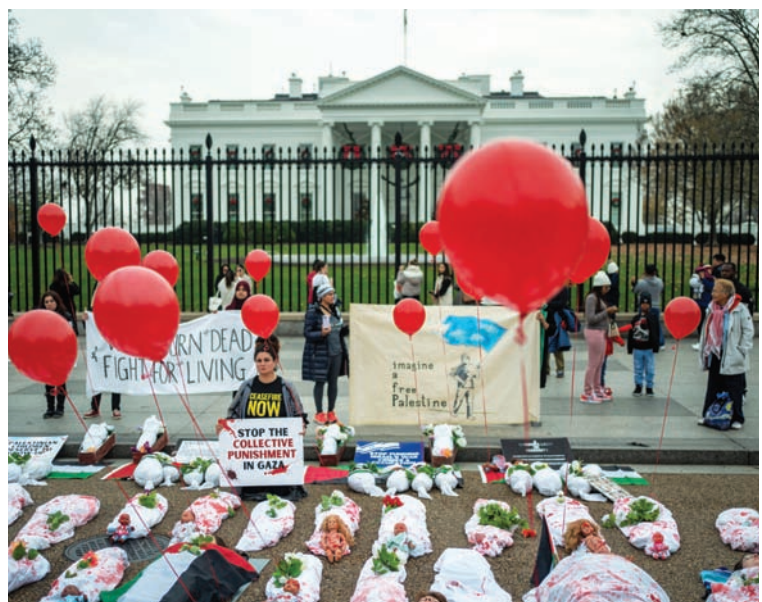
متظاهرون كفنوا أنفسهم استلقوا أمام البيت الأبيض تنديدا بسقوط آلاف القتلى في غزة