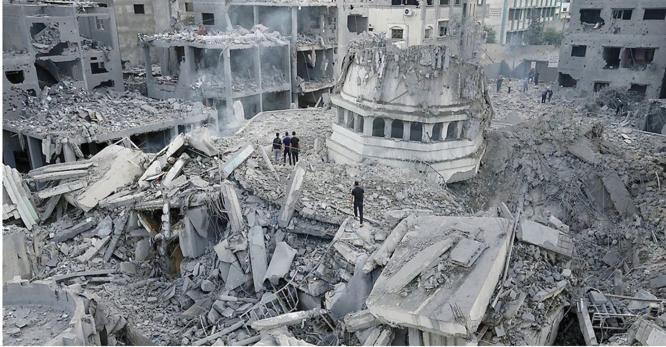
صور من حرب غزة