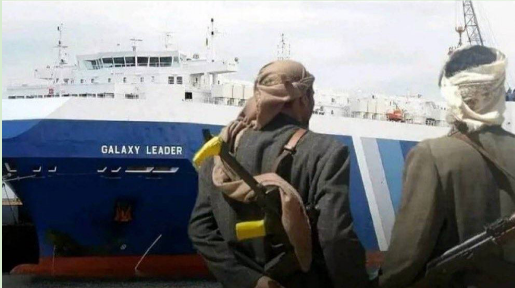
مسلحان حوثيان يقفان أمام السفينة الدولية «غالاكسي ليدر» المختطفة لدى الجماعة

وتصحت الهيئة السفن القريبة من المنطقة باتباع التوجيهات بشأن الذخائر الطائرة، وتوخي الحذر وإبلاغها عن أي نشاط مريب. وفق ما نقلته وكالة أنباء العالم العربي. وجاء هجوم الجماعة الحوثية عقب تنديد مجلس الأمن الدولي بأشد العبارات بالهجمات الأخيرة التي شنتها الجماعة على سفينة إيران قرصنت الشهر الماضي سفينة «غالاكسي ليدر»، وهي سفينة شحن دولية تديرها شركة يابانية، كما تبنت إطلاق الصواريخ والطائرات المسيرة باتجاه إسرائيل.