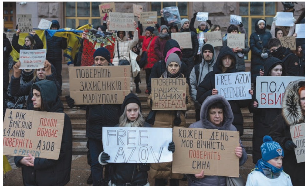
أوكرانيون تظاهروا في كييف أمس للمطالبة بالإفراج عن جنود «كتيبة أزوف» الذين أسرتهم روسيا في معركة ماريبول (أ.ب)

أخرى، كييف بشأن ضربات عدة في منطقة بيلغورود الروسية الحدودية مع أوكرانيا، دون وقوع ضحايا أو أضرار كبيرة. واستهدفت قرى عدة بمسيرات وقصف مدفعي، وفق الحاكم المحلي فياتشيسلاف غلادكوف. وبخصوص الوضع الميداني في بلدة أفدييفكا الواقعة في إقليم دونيتسك والتي تتعرض لقصف روسي متواصل، انخفضت وتيرة الهجمات البرية خلال الساعات الأربع والعشرين الماضية على البلدة بسبب «الخسائر البشرية الفادحة» للروس، والأحوال الجوية القاسية، وفق ما ذكر رئيس البلدية فيتالي باراباخ، أمس. ويحاول الروس، منذ شهرين تقريبا، تطويق مدينة أفدييفكا بالقرب من دونيتسك، والسيطرة على هذا المركز الصناعي الذي أصبح من أكثر النقاط رمزية على الجبهة. ويتركز الجنود الروس في شرق وشمال وجنوب المدينة التي أصبحت الآن مدمرة بشكل كبير وشبه محاصرة ولكنها لا تزال محيطة بطريق معبدة، وتؤكد أوكرانيا أن جنودها صامدون، ويصدون الهجمات.