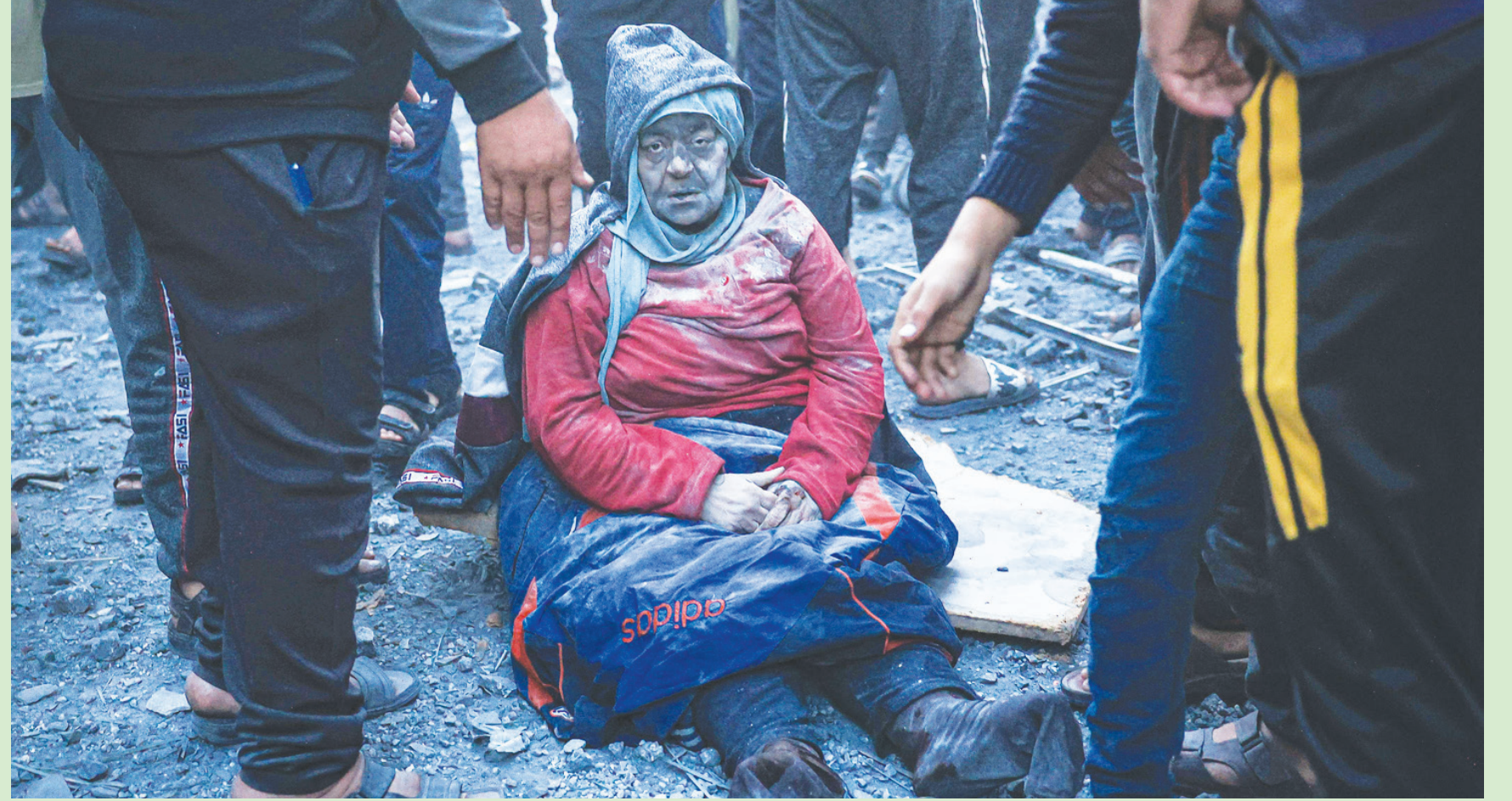
فلسطينية أصيبت بضرية جوية إسرائيلية تجلس وسط الركام في رفح جنوب قطاع غزة أمس (أ.ف.ب)

غزة - رام الله - الدوحة: «الشرق الأوسط» وسعت إسرائيل عملياتها البرية تجاه جنوب قطاع غزة، بعد أن سيطرت خلال الأسابيع الماضية على غالبية شمال القطاع. وأمر الجيش الإسرائيلي، أمس، سكان مدينة خان يونس، ثاني أكبر مدن القطاع، وما حولها بإخلائها. كما قصفت الدبابات الإسرائيلية مواقع في شمال خان يونس، مباشرة بعد أن أعطى الجيش أوامر الإخلاء، التي طُلِف فيها من سكان 5 مناطق وأحياء المغادرة، وأسقط منشورات تامرهم بالتحرك جنوباً إلى مدينة رفح الحدودية، أو إلى منطقة ساحلية في الجنوب الغربي. وجاء في المنشورات أن «مدينة خان يونس أصبحت منطقة قتال خطيرة». ومن المرتقب أن يركز الهجوم الجنوبي على خان يونس، بوصفها ثاني أهم مركز حضري في غزة، ومسقط رأس قادة الدرع في حركة «حماس»، من بينهم زعيم الحركة يحيى السنوار ومحمد الضيف. وتعتد إسرائيل بان السنوار بدير العمليات العسكرية للحركة مع رئيس الذراع العسكرية محمد الضيف، وعدد قليل من كبار القادة الآخرين في الحركة. وقالت إسرائيل أيضاً إن قواتها عثرت على أكثر من 800 من فتحات الأنفاق منذ بدء العملية العسكرية في غزة، وتم تدمير نحو 500 منها. من جانبها، طلبت الولايات المتحدة من إسرائيل تجنب حدوث نزوح جماعي كبير جديد، وبذل مزيد من الجهد لحماية المدنيين في أثناء