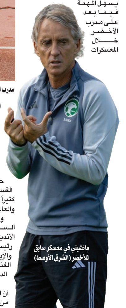
مانشيني في معسكر سابق للأخضر

وعقدت رابطة دوري المحترفين السعودي اجتماعاً مع مدربي الأندية، الأحد، بحضور ياسر المسجل رئيس الاتحاد السعودي لكرة القدم والإيطالي روبرتو مانشيني، المدير الفني للأخضر، لمناقشة روزنامة الدوري خلال المواسم المقبلة. وعلمت «الشرق الأوسط» أن الاجتماع شهد مناقشة عديد من الأمور المهمة مثل إيجابيات