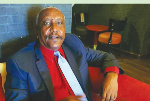
السياسي السوداني ياسر عرمان

وبناء دولة جديدة، وجيش جديد ومؤسسات تعطي الفرصة لبناء مشروع وطني يحقق الديمقراطية والاستقرار في البلاد». ومنذ الإعلان عن إنهاء عمل «يونيتامس»، يخير البعض تساؤلات بشأن ما إذا كان ذلك يعني وقوع السودان تحت بنود الفصل السابع من ميثاق الأمم المتحدة»، الذي يطوي على اليات «ما يتخذ من الأعمال في حالات تهديد السلم والإخلال به، ووقوع العدوان». ويرى عرمان أن الدخول تحت ترقيات ذلك الفصل «يعتمد على تطورات الحرب، ومدى تشكيلها تحدياً كبيراً بالنسبة للمدنيين، ما يجبر المجتمع الدولي على اللجوء لذلك المسار الذي يتضمن تكاليف كبيرة وواسعة». ودعا قرار مجلس الأمن إلى البدء فوراً بوقف عمليات «يونيتامس» ونقل مهامها إلى وكالات الأمم المتحدة وبرامجها وصناديقها، بهدف إنهاء تلك العملية بحلول 29 فبراير (شباط) 2024.