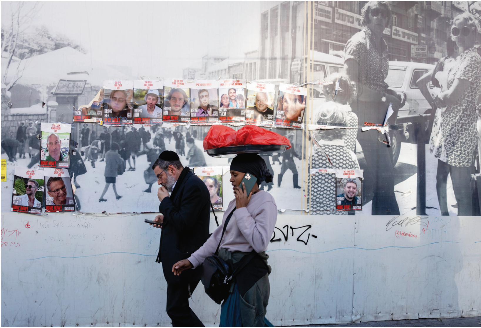
جدار في القدس يحمل صور الرهائن الذين يعتقد أنهم ما زالوا محتجزين في غزة