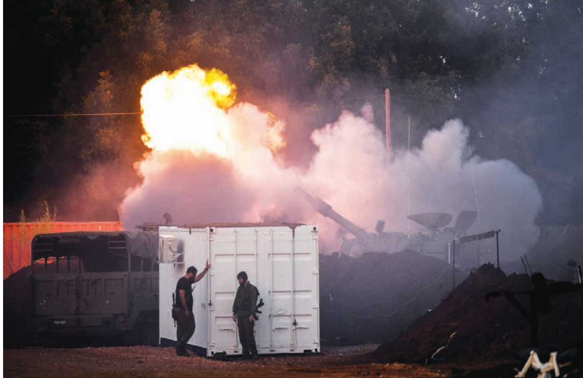
بطارية مدفعية إسرائيلية تطلق قذائفها باتجاه الأراضي اللبنانية