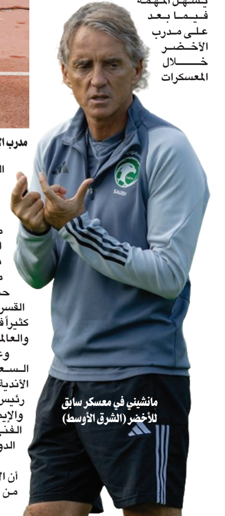
مانشيني في معسكر سابق للأخضر