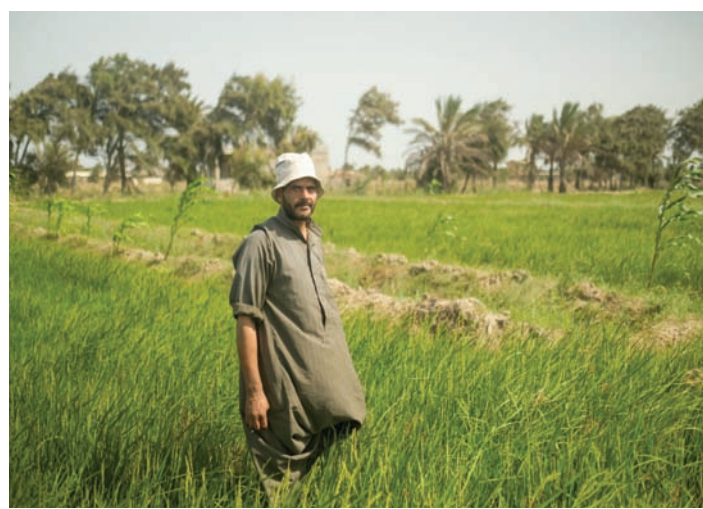
دلتا نهر النيل تعاني من الكثافة السكانية المرتفعة

لكن في المقابل، في مناطق الدلتا الأخرى، مثل نهر ميكونغ (فيتنام)، والميسيسيبي (الولايات المتحدة)، وكريشنا وجودافاري (الهند)، والتي لا تتمتع بكثافة سكانية عالية مثل نهر النيل، يعد هبوط الأرض والارتفاع النسبي لمستوى سطح