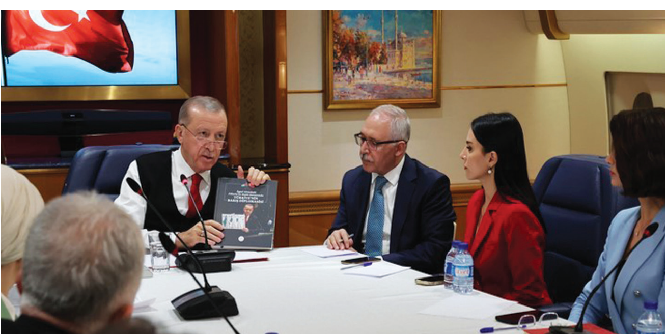
إردوغان متحدثاً لصحافيين رفاقوه على طائرته من دبي

وقال المتحدث باسم الوزارة، أونجو كيتشلي، في بيان، إنه جرى استئناف إجلاء المواطنين الأتراك من غزة، السبت، وعبور 142 منهم إلى مصر في طريقهم للعودة إلى تركيا.