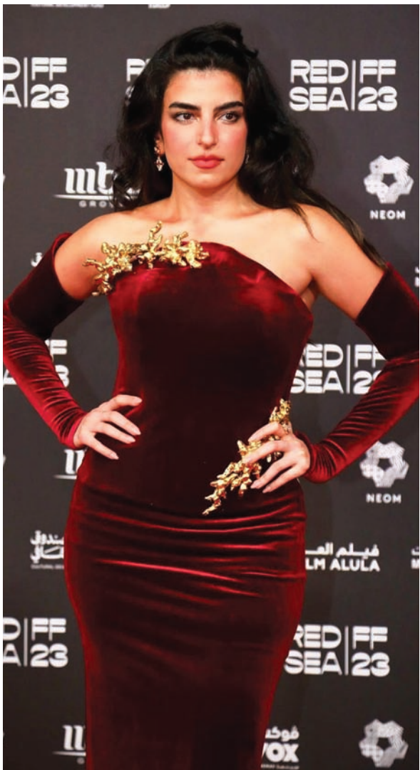
الفنانة السعودية نور الخضراء