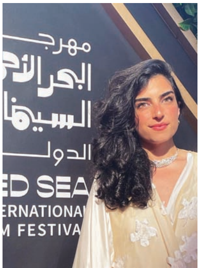
نور تفضّل السينما خلال الفترة الراهنة