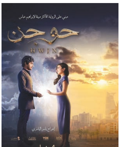
أفيس فيلم «حوجن»...