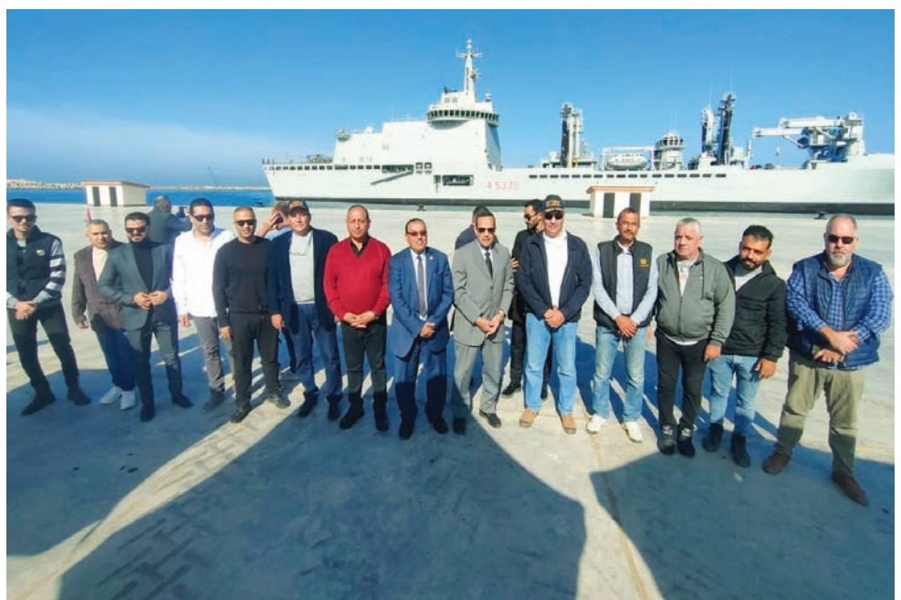
سفينة طبية إيطالية تصل إلى ميناء العريش البحري (محافظة شمال سيناء)

ونقل بيان للمحافظة عن قائد السفينة الطبية الفرنسية قوله إن السفينة «ديكسمود» من فئة «المستقرال»، وهي عبارة عن مستشفى عائم بطاقة 40 سريراً و25 سريراً داخلياً و15 سرير عناية متوسطة و5 أسرة عناية بالأطفال، وغرفتي عمليات