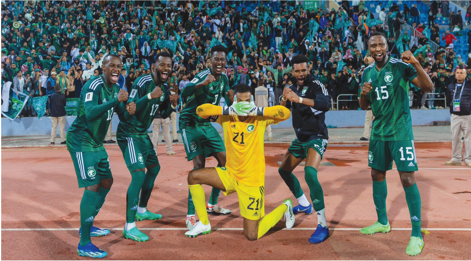
مدرب الأخضر يرى ضرورة مشاركة الدوليين بصفة أساسية في أنديةهم (الشرق الأوسط)

ورغم وجود ممثل للجنة الحكام خلال هذا الاجتماع، إلا أن المدربين لم تطرقوا للحديث عن أي مشكلات تحكيمية.