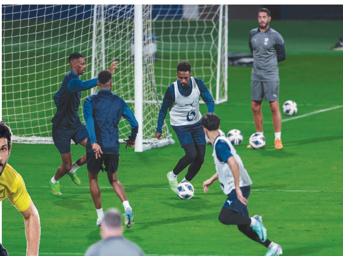
من تدريبات الهلال الأخيرة (نادي الهلال)

في المقابل ليس أمام سيهاهان خيار سوى الفوز ليضمن التساهل دون النظر لبقيّة نتائج المجموعات، أما أي نتيجة أخرى فستدخله في نقق الحسابات المعقدة، وسينتظر بقية النتائج لمعرفة مصيره. وفي مواجهة تحصيلية في المجموعة الثالثة ذاتها، يستضيف القوة الجوية العراقي نظيره أجمك الأوزبكي لتحقيق فوز معنوي قبل نهاية مشاركة الفريقين في البطولة، خصوصاً بعد خسارة الفريق العراقي الجولة الماضية أمام التاهل عقب تعثره أمام سيهاهان الإيراني.