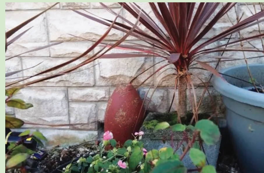
طلبت القنبلة باللون الأحمر

إزالة القنابل ستصل في اليوم التالي. وقضى الزوجان هذه الليلة بلا نوم، بعد أن علما أن الشارع بأكمله قد يحتاج إلى الإخلاء. ويقول إدواردن: «لم يفض لنا جفن طوال هذه الليلة بسبب التفكير». مضيفاً: «لقد أخبرت وحدة التخلص من القنابل باننا لن نغادر المنزل، وسنبقى بداخله، فإذا طار في الهواء جراء الانفجار فإننا سننظر بداخله». وقد أثبتت الاختبارات أن القنبلة كانت تعمل بالفعل، ولكن قوتها التفجيرية كانت محدودة، وتم نقلها إلى مجر مهجور في قلعة والوين، مغطى بخمسة أطنان من الرمال حيث جرى تفجيرها.