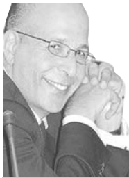
د. مأمون فندي

نظرية النصر الأميركية مرتبطة بالنصر على الدول التقليدية وقد فشلت في ردع الجماعات والحركات