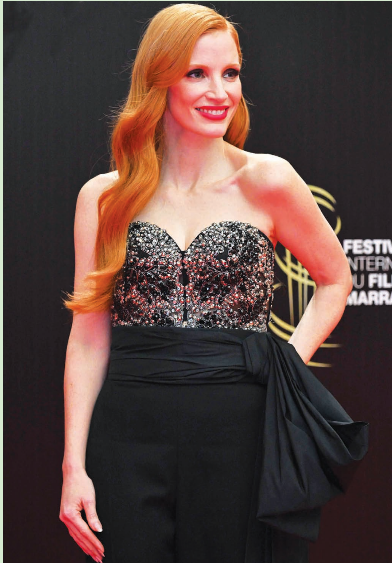
الممثلة الأمريكية جيسكا ساستاين لدى حضورها الحفل الختامي لمهرجان مراكش، في المغرب

لا نقول إن الشرعية اليمنية والتحالف وغيرهما من أطراف المسألة اليمنية عملهم خال من الماخذ، لكن ذلك بحث آخر، بحثنا اليوم هو في دور الغرب في تاييد وتخليد العطل في اليمن، لأغراض غير مُفصح عنها علناً، واليوم كأنهم يكتشفون، بدهشة، خطورة الحوثي على الأمن العالمي... ما هذا!؟