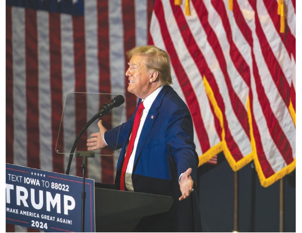
الرئيس السابق دونالد ترمب المرشح الرئاسي الجمهوري متحدثاً خلال حملة انتخابية في أيوا السبت

لأنه كان رئيساً وقت وقوع الأحداث المعنية. وقال سادو إنه إذا رفض طلب تأجيل محاكمته في قضية فولتون، فسيسعى إلى الاستئناف، ويمكن أن يطلب المراجعة من قبل المحكمة العليا في جورجيا. وقال مكافي إنه لا يعززم اتخاذ أي قرار بشأن موعد المحاكمة،