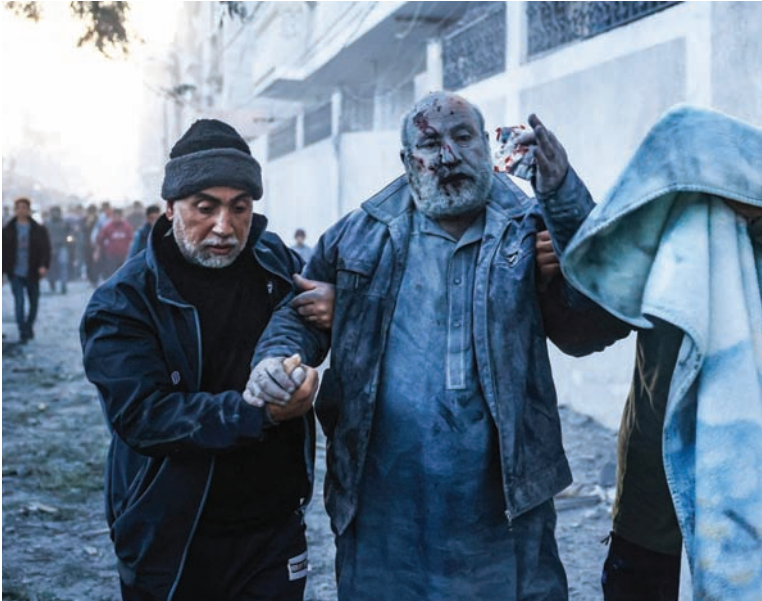
فلسطيني أصيب في غارة إسرائيلية على رفح جنوب قطاع غزة أمس