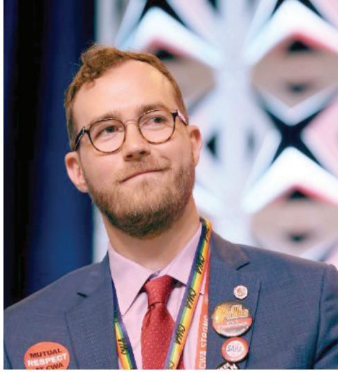
جوس شلوس (حسابه على موقع «إكس»)