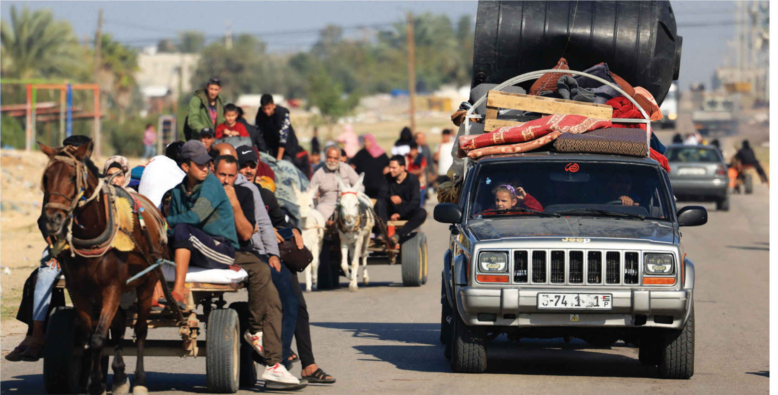
مدنيون يفرّون من خان يونس في جنوب قطاع غزة بعد أن دعا الجيش الإسرائيلي الناس إلى مغادرة مناطق معينة في المدينة أمس