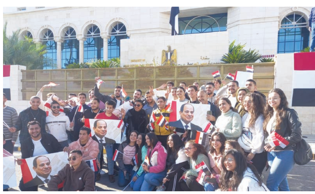
مصريون في الأزهر يرفعون صور السيسي وأعلاماً مصرية في اليوم الأخير من الانتخابات

وتعد اللجنة الفرعية في ويلنغتون بنيوزيلندا أول لجنة تنتهي من عملية التصويت في الانتخابات الرئاسية، بحكم موقعها الجغرافي وفرق التوقيت عن القاهرة، ومع انتهاء الموعد المحدد، قام مسؤولو اللجنة الفرعية