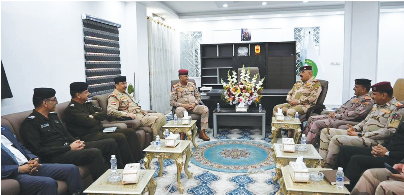
رئيس اللجنة الأمنية العليا لانتخابات مجالس المحافظات الفريق أول الركن قيس المحمداوي في البصرة

الرئيسي في محافظة البصرة بقذيفة صاروخية، فضلاً عن استهداف مكتب مرشحيه للانتخابات المحلية من قبل أشخاص خارجين عن القانون»، وأضاف أن «هذه الممارسات الخارجة عن القانون لا تزيدينا إلا إصراراً على مواصلة مشروعنا السياسي». من جانبها، أرسلت الحكومة