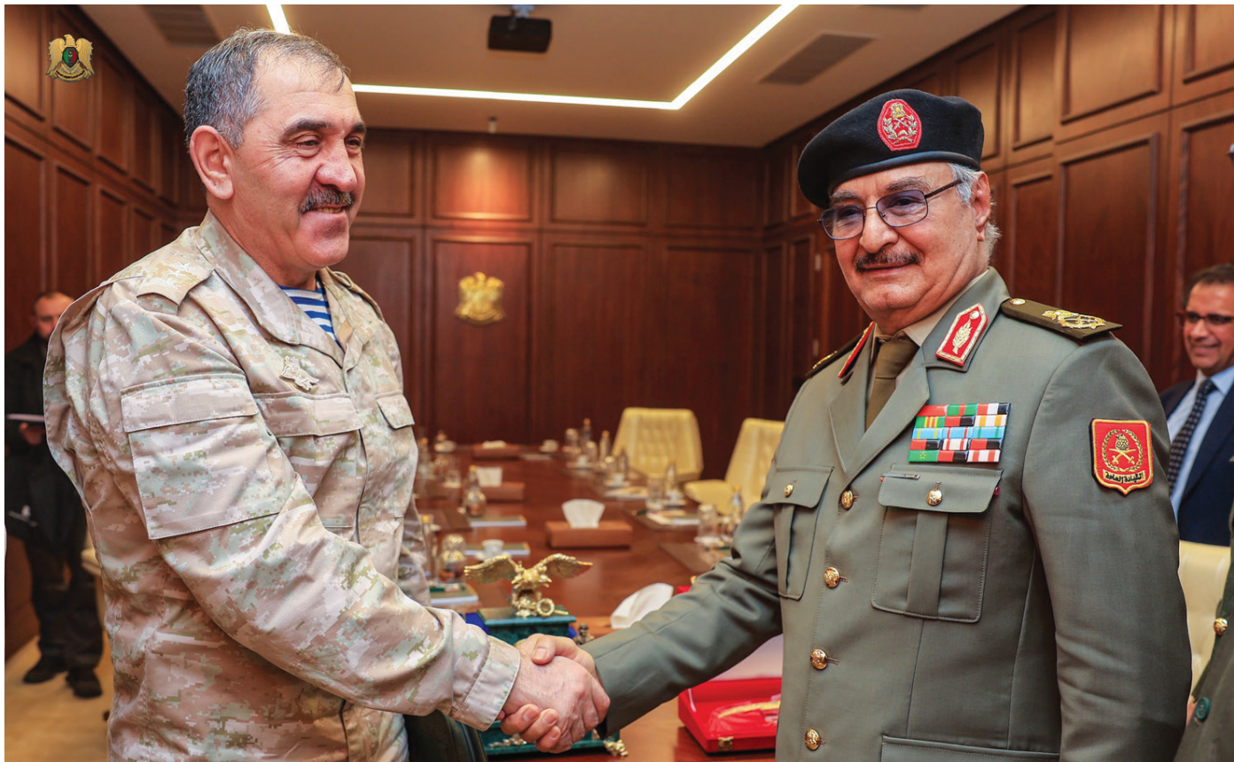
حفر يلتقي نائب وزير الدفاع الروسي في بنغازي (الجيش الوطني)

وهذه هي الزيارة الثانية من نوعها، التي يقوم بها وفد روسي رفيع المستوى بقيادة بغيروف، لقر حفر في بنغازي خلال شهرين، علماً بأنها تأتي بعد تحذير مسؤول في الخارجية