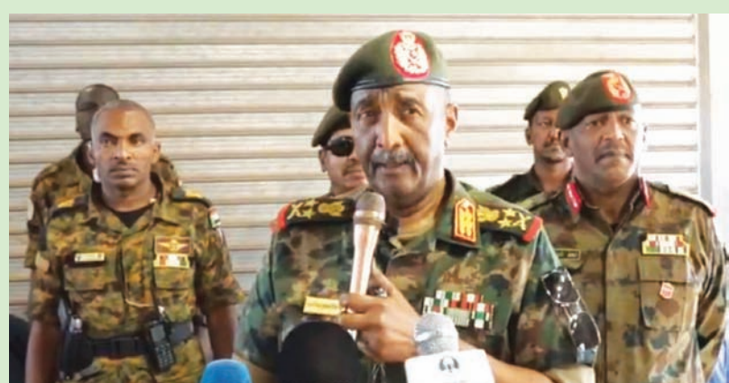
رئيس مجلس السيادة السوداني عبد الفتاح البرهان أمس في ود مدني

«غير مقبولة»، بقوله: «أهنا للتفاوض بقلب مفتوح من أجل الوصول لسلام، لكن مفاوضات لا تلبى رغبة الشعب السوداني تكون مقبولة، مفاوضات ليس فيها خروج من مناطق القتال لن تكون مقبولة أبداً». البرهان أبدى كذلك ترحيباً بقرار مجلس الأمن الدولي الذي أنهى «بعثة الأمم المتحدة المتكاملة لدعم الانتقال في السودان» (يونيتامس)، محذراً في الوقت نفسه المبعوث الجديد للأمين العام للأمم المتحدة، رمطان لعمامرة، مما سماه «مصير سابقه»، «حال اصطفاة مع طرف من أطراف الصراع»، وفق تعبيره.