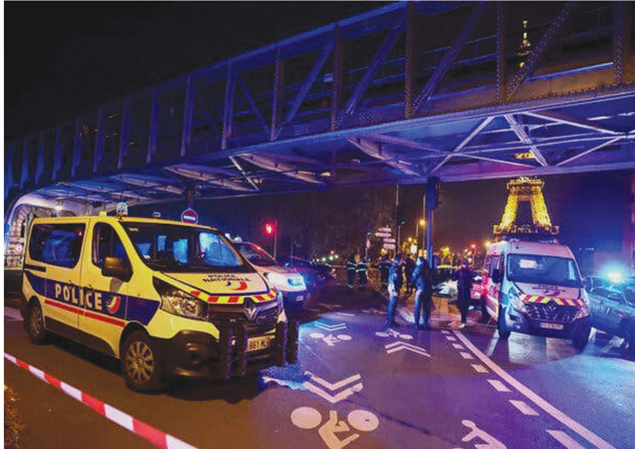
استفزاز أمني بالقرب من «جسر بير حكيم» في باريس بعد أن هاجم رجل مسلح بسكين ومطرقة الناس ما أسفر عن مقتل سائح ألماني (رويترز)

وقال وزير الداخلية الفرنسية، جيرالد دارمانان، إن المهاجم قال لعناصر الشرطة الذين اعتقلوه إنه «لم يعد يمكنه تحمل موت المسلمين في أفغانستان وفلسطين»، وإن فرنسا «مواطننة في ما تفعله