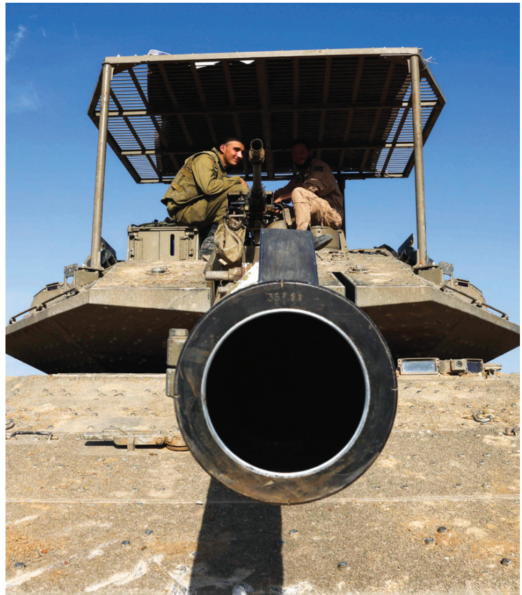
تمركز القوات العسكرية الإسرائيلية بالقرب من الحدود مع قطاع غزة أمس

من قبل أعضاء «زاكا»، الذين تحدث أحدهم عن مشهد فظيع آخر، هو العثور على جثة امرأة وجدها في كيبوتس بثري، وقد كان بطنها مفتوحاً والجثتين الذي كان مربوطاً بالحبل الشري وجد مطعوناً أيضاً. وقد كرر شهادته هذه في محادثة مع المشهد في الكيبوتس، و«كان هناك الكثير من الدماء». وأضاف: «عندما قمنا بتحركها رأينا بطنها مفتوحاً والسكين كانت قربها، والجثتين مربوط بالحل الشري. وقد تم إطلاق النار عليها من الخلف».