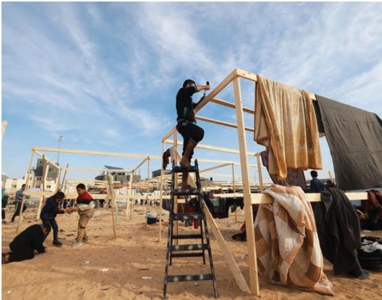
نازحون فلسطينيون من وسط وجنوب غزة نصبوا خياماً في «تل السلطان» الجديد غرب رفح