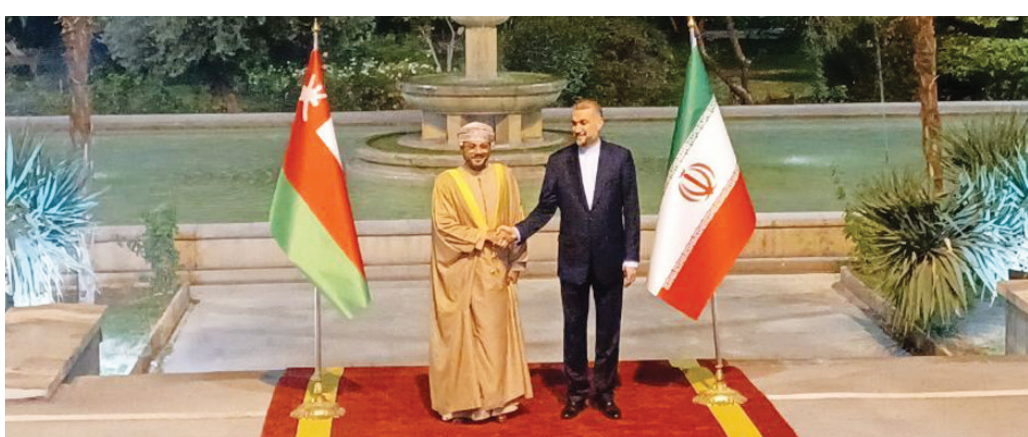
عبداللهيان يستقبل نظيره العماني بدر البوسعيدي في مقر الخارجية الإيرانية وسط طهران أمس (أرنا)

واستقبل عبداللهيان نظيره العماني في وقت متأخر أمس، وذكرت وكالة «إرنا» الرسمية أن مناقشة أهم القضايا ذات الاهتمام وتطوير التعاون المشترك، وأهم القضايا الإقليمية، منها الأوضاع المزمنة في غزة، وضرورة وقف إطلاق النار، وإرسال المساعدات الإنسانية لشعب غزة، على جدول أعمال لقاء الوزيرين. وعشية زيارته إلى طهران، تواصل البوسعيدي ونظيره الإيراني عبر الهاتف. وقال عبداللهيان إن «عودة إسرائيل لارتكاب جرائم الحرب ضد أهالي غزة تدل على عدم اكتراثهم بمطالب المجتمع الدولي والرأي العام العالمي».