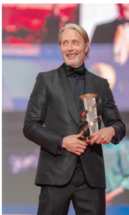
الممثل الدنماركي مادس ميكلسن