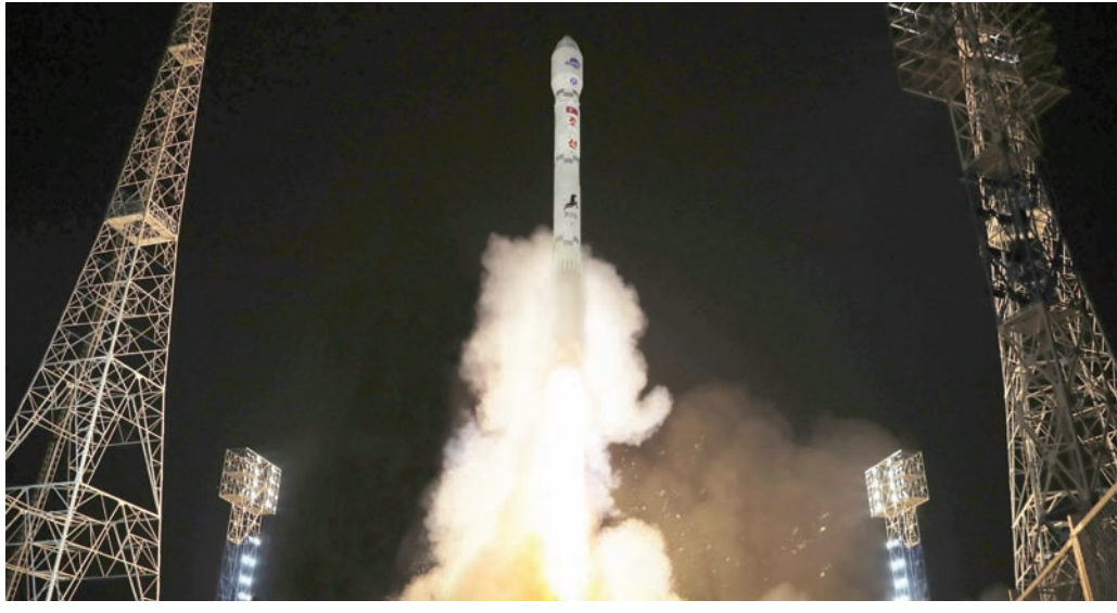
صورة وزعتها كوريا الشمالية لإطلاق القمر الاصطناعي التجسبي الثلاثي

بيونغ يانغ لقمرها الاصطناعي بتعليق الالتزام ببعض بنود الاتفاقية العسكرية الشاملة لعام 2018، التي رُحِب بها في حينه الرئيس الكوري الجنوبي مون جاي، باعتبارها خطوة رئيسية نحو تحسين العلاقات مع بيونغ يانغ. وبعد ذلك، أعلنت حكومة الرئيس الحالي يون سوك يول تكرار انتهاك بيونغ يانغ للاتفاقية، وانتقدت سول في الاستطلاع الجوي على امتداد المنطقة منزوعة السلاح بين شطري شبه الجزيرة الكورية.