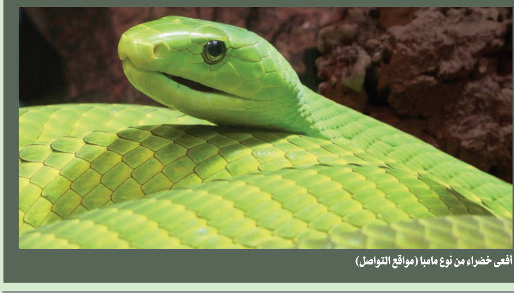
أفعى خضراء من نوع مامبا

يجول مندوبو «جينشانغ» مساء كل يوم على مئات المطاعم في شينغدو. وما إن يغادر الزبائن، حتى يجار موظفوها ونُدلها إلى صبّ المرق في مرشح لفصل الزيت عن الماء. يرتدون لهذا الغرض مازز سمينة وقفازات مطاوية بطول الكوع لحماية أنفسهم، ثم يجمع مندوبو الشركة الصفائح الملوّعة بهذا السائل.