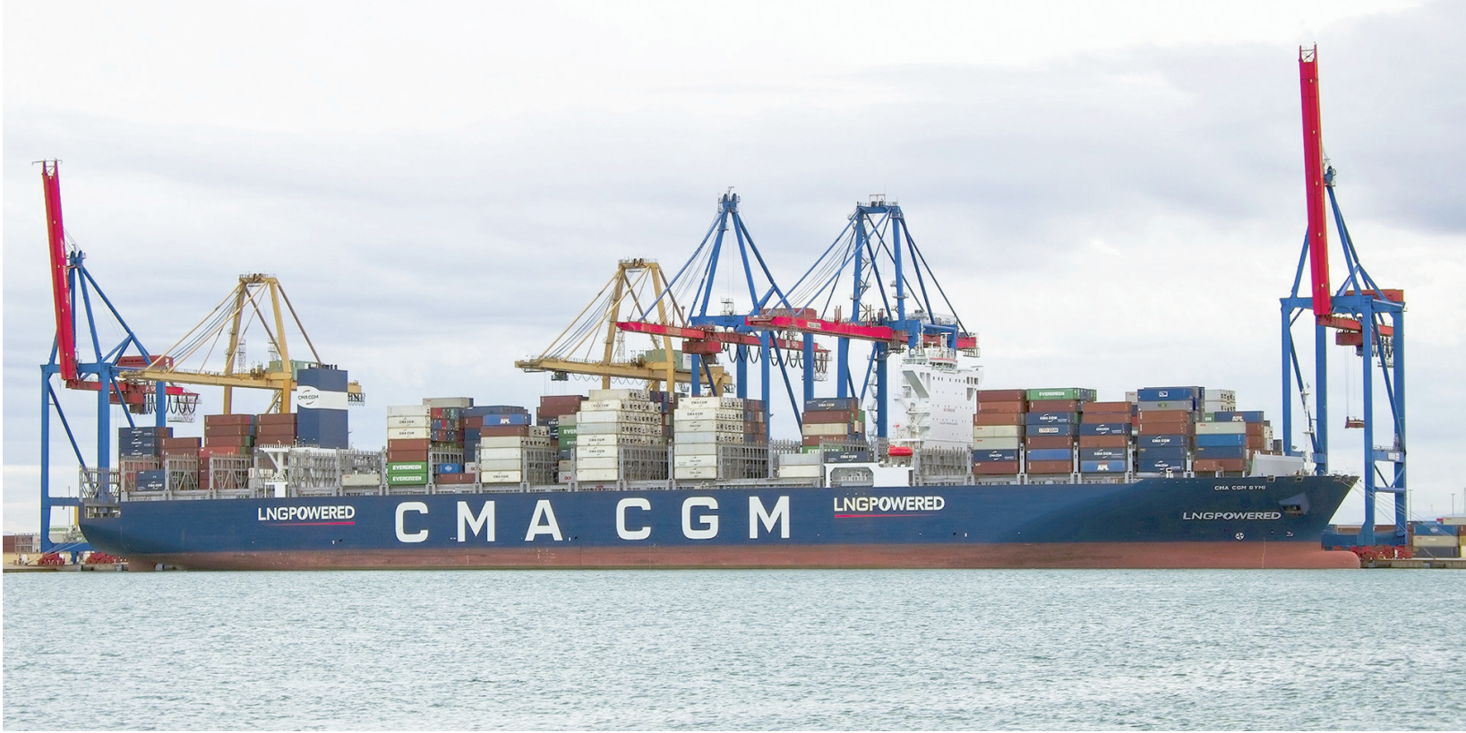
السفينة «سي إم إيه سي جي إم سيمي» التي تعرضت لهجوم في المحيط الهندي خلال رسوها في ميناء فاننسيا بإيطاليا في 22 أكتوبر الماضي

يأتي الحادث وسط تصاعد التوتر الأمني البحري بسبب الحرب بين إسرائيل و«حركة المقاومة الإسلامية» الفلسطينية (حماس)، وفي أعقاب استيلاء الحوثيين اليمنيين المتحالفين مع إيران على سفينة شحن مرتبطة بإسرائيل في جنوب البحر الأحمر الأسبوع الماضي. ووصفت إسرائيل احتجاج السفينة بأنه «عمل إرهابي إيراني». وقالت شركة «إيسترن باسفيك شيبينغ» (إي بي إس) التي تتخذ من سنغافورة مقراً وتستاجر «ماييت» أنها علمت باستهداف سفينة حاويات في حادث أمني محتمل الجمعة. وذكرت «إي بي إس» في بيان أرسل إلى «رويترز»، أن «السفينة المعنية تبحر حالياً كما هو مخطط لها. جميع أفراد الطاقم بخير وبوصحة جيدة». ويسيطر على شركة «إي بي إس» الملياردير الإسرائيلي عيدان عوفر، وتعرضت سفنها في السابق لهجمات مماثلة. والقت الولايات المتحدة باللوم على إيران في هجمات لم تعلن أي جهة مسؤوليتها عنها على عدة سفن في المنطقة خلال السنوات القليلة الماضية. ونفت طهران ضلوعها في الهجمات. وفي حادث منفصل، قالت هيئة عمليات التجارة البحرية البريطانية، السبت، إن سفينة تلتقت أمراً بتغيير مسارها في البحر الأحمر من كيان يصف نفسه بأنه ممثل للسلطات اليمنية.