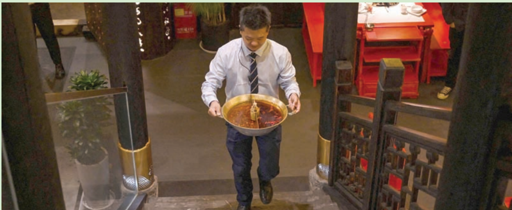
معالجة مخلفات «الفونديو» تأتي بزيّت أصفر ذي نوعية صناعية

ويصل حجم الإهدار الغذائي السنوي للمطاعم، ومتاجر السوبر ماركت، والمستهلكين في الصين إلى نحو 350 مليون طن من المنتجات الزراعية، وفقاً ما يفوق ربع الإنتاج السنوي، وفقاً لدراسة نشرتها مجلة «نيتشر» عام 2021.