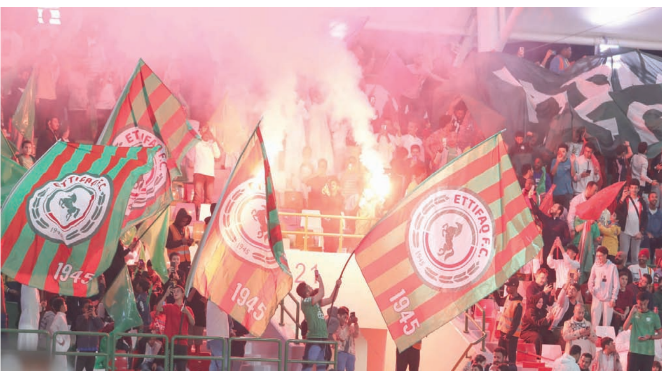
الجفيمان أكد أنهم سيسعون لتلافي الأخطاء التنظيمية على ملعبهم مستقبلاً (نادي الاتفاق)

وحسم التعادل الإيجابي لقاء الاتفاق والاتحاد بهدف لكل فريق، في أول مواجهة يحتضنها ملعب