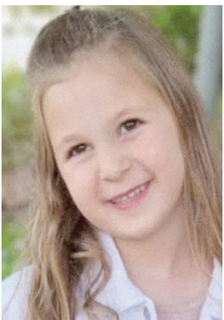
الطفلة الربة المفرج عنها ران كاتز - أشر