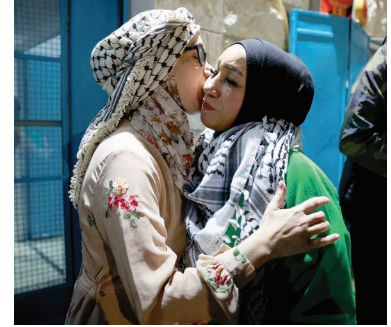
ترحيب بأسيرة محررة قرب رام الله ليلة الجمعة

الباخرة الثانية تتجه إلى بورسعيد والطائرة الـ19 تحط بالعريش