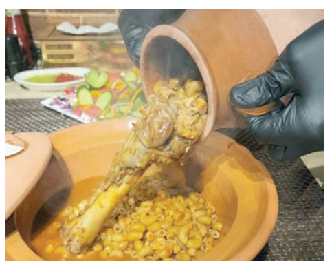
لحم ضأن مع صلصة طماطم (الشرق الأوسط)

باكثر من طريقة عربية، منها طريقة المطبخ الفلسطيني والليبي والمغربي، حيث تختلف المكونات من بلد إلى آخر، ويعد المكون الرئيسي لـ«الكسكي» من «طين مجلب بماء ويتم برمه أو يفتل