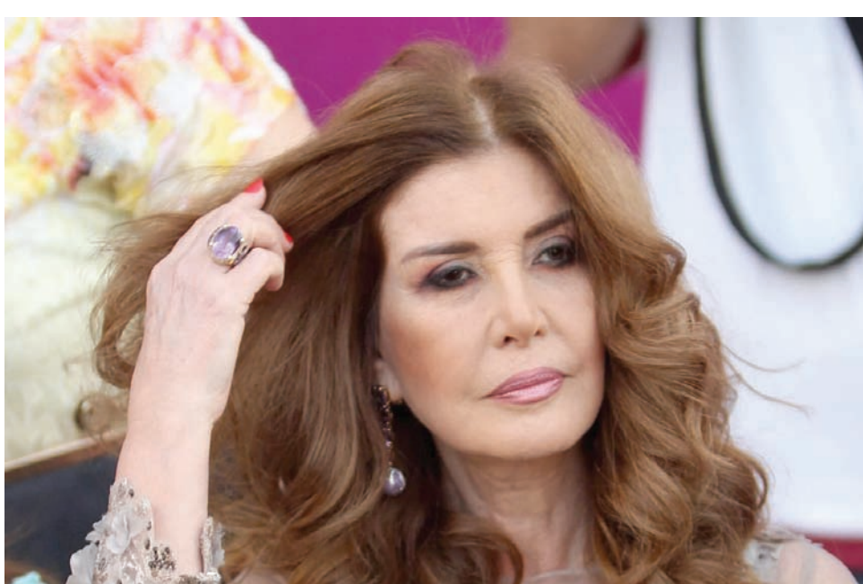
الفنانة المصرية ميرفت أمين

وترى أمين أن «القبول» أهم من الجمال، لأن الشكل الخارجي تعادته العين مع الوقت ويصبح عادياً، لكن ثمة عدداً للقاهرة، وأنا خليط من أبي وأمي في الملامح وفي الهدوء الذي كانا يتمتعان به».