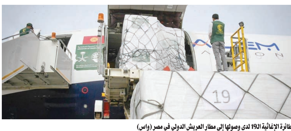
الطائرة الإغاثية الـ19 لدى وصولها إلى مطار العريش الدولي في مصر (واس)

وتأتي هذه المساعدات في إطار دور السعودية التاريخية المعهود بالوقوف مع الشعب الفلسطيني في مختلف الأزمات والمحن التي يمر بها، وفي إطار الجهود الإغاثية والإنسانية التي تقدمها المملكة لإغاثة الشعب الفلسطيني الإنسانية «مركز الملك سلمان للإغاثة». إلى ذلك، تخطى مجموع تبرعات الحملة السعودية الشعبية لإغاثة الشعب الفلسطيني في قطاع غزة أكثر من 531 مليون ريال، حتى مغرب الجمعة.