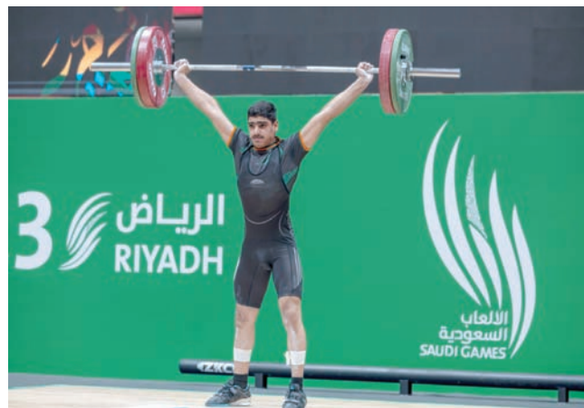
من منافسات رفع الأثقال في الدورة (الشرق الأوسط)

تواصلت أمس منافسات دورة الألعاب السعودية في نسختها الثانية على أن تنطلق اليوم منافسات التايكوندو والسباحة وكرة قدم الصالات