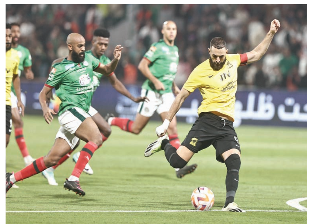
من مواجهة التي جمعت الاتحاد والاتفاق على ملعب الأخير