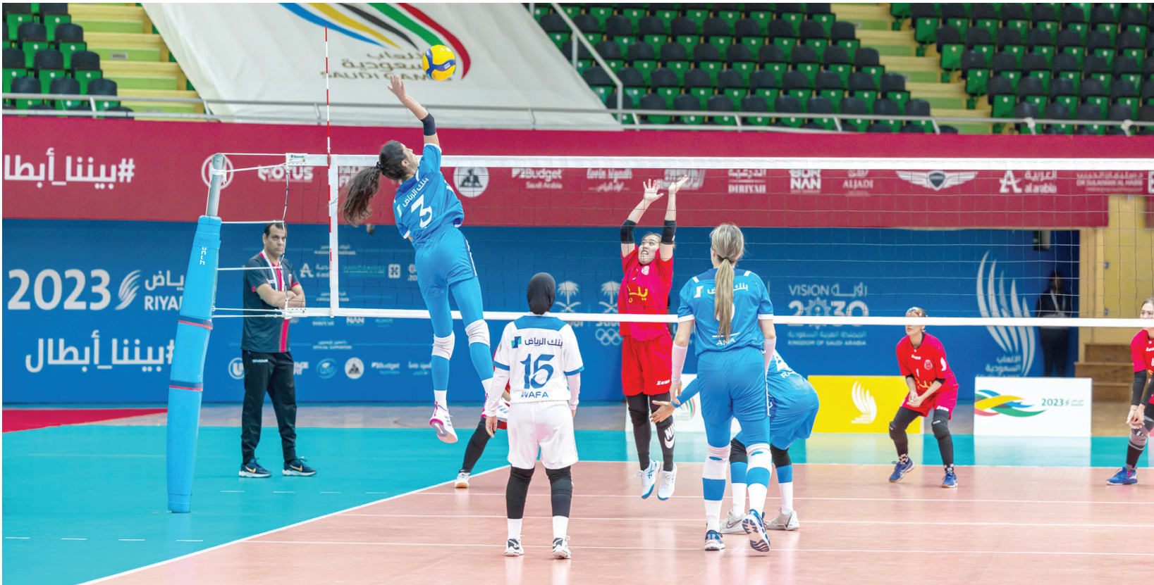
من مباراة الهلال والرياح في منافسات الكرة الطائرة للسيدات

وفي مباريات كرة السلة على الكراسي المتحركة للرجال، التي تقام في صالة الألعاب البارالمبية في مجمع الأمير فيصل بن فهد الأولي، تغلب الرس على الشرقية بنتيجة 106-2.