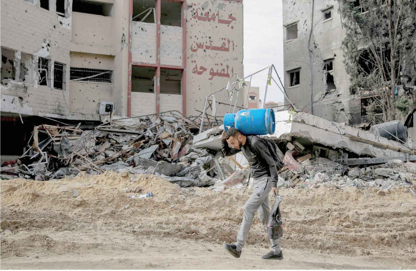
أمنية دمرها القصف الإسرائيلي على غزة

وأضاف أنه تم خلال اليوم الأول من الهدنة استقبال 17 مصاباً يرافقهم 15 شخصاً، كما تم استقبال 12 من المصابين الفلسطينيين ممن جرى سفرهم مع مرافقهم إلى دولتي الإمارات وتركيا، منوهاً بعودة مجموعة من الفلسطينيين العالقين في مصر إلى قطاع غزة، بناءً على رغبة، ووصل عددهم إلى 134 فلسطينياً خلال اليوم الأول من الهدنة. وقررت إسرائيل على قطاع غزة الذي يخضع أصلاً لقيود شديدة منذ وصول «حماس» إلى السلطة عام 2007، «حصاراً كاملاً» منذ التاسع من أكتوبر الماضي، وقطعت عنه إمدادات الماء والغذاء والكهرباء والدواء والوقود.