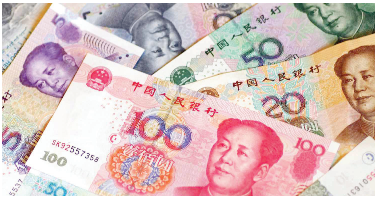
فئات متنوعة من اليوان الصيني

في بكين. وأضافت الوزارة أن الالتزام المتجدد يأتي بالتزامن مع نشر خطة عمل يوم الخميس الماضي، تقترح أكثر من 170 مهمة تجريبية لدعم بكين في تعميق بناء المنطقة النموذجية الوطنية المتكاملة لفتح قطاع الخدمات. وقال لينج جي، نائب وزير التجارة في مؤتمر صحفي، إن المنطقة