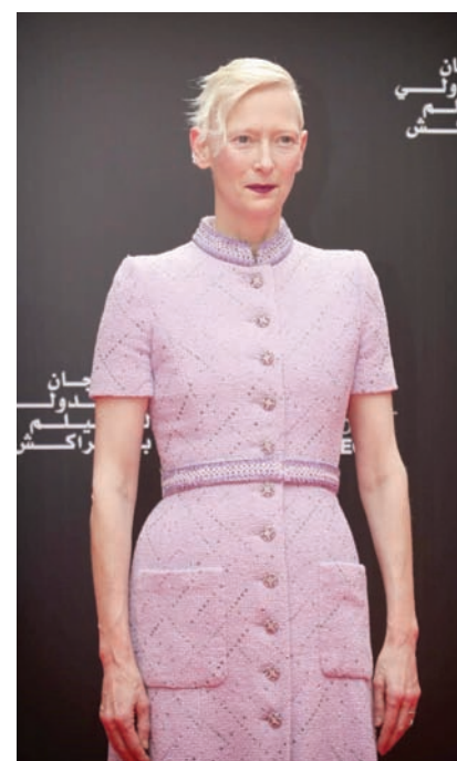
الممثلة تيلدا سوينتون (الجهة المنظمة)