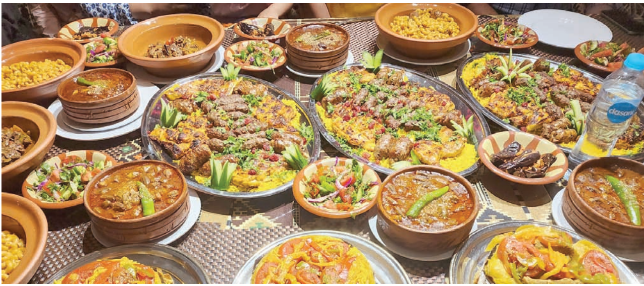
تشكيلة كبيرة من الأطباق اللذيذة (الشرق الأوسط)

أشهرها «المقلوبة» الفلسطينية و«المببكة» الليبية