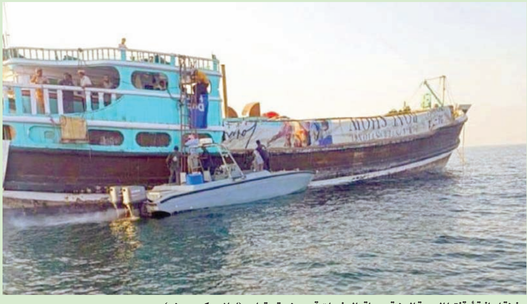
سفينة إيرانية أوقفتها البحرية اليمنية محملة بالمخدرات قرب جزيرة سقطرى (إعلام حكومي يمني)

وتعود آخر مرة جرى فيها ضبط مخدرات إيرانية متجهة إلى الجماعة الحوثية إلى ما قبل ثلاثة أسابيع، حيث ألقت الأجهزة الأمنية في محافظة المهرة، على الحدود الشرقية للبلاد، القبض على خمسة من المهربين الإيرانيين، وبعونتهم أربعة أطنان من المخدرات على متن زورق مخصص لأعمال التهريب. واعترف البحارة الإيرانيون بأن