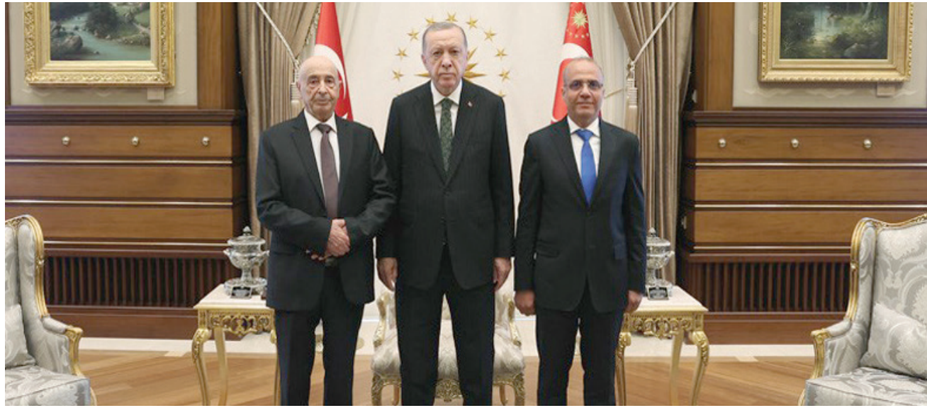
إردوغان مستقبلاً عقيلة صالح للمرة الأولى بأنقرة في 2 أغسطس 2022 بحضور نائب رئيس المجلس الرئاسي الليبي عبد الله اللافي

وأضافت المذكرة أن هذه القوات تهدف أيضاً إلى الحفاظ على الأمن ضد المخاطر المحتملة الأخرى، مثل موجات الهجرة الجماعية، وتقديم المساعدات الإنسانية التي يحتاجها الشعب الليبي، وتوفير الدعم اللازم له الحكومة الشرعية، في ليبيا. وأرسلت تركيا قواتها إلى غرب ليبيا بموجب المادة 92 من الدستور، بحسب ما ورد في المذكرة بتاريخ 2 يناير (كانون الثاني) 2020، وتم تمديد مهامها في 21 يونيو (حزيران) 2021 لمدة 18 شهراً. ودعت مذكرة الرئاسة التركية