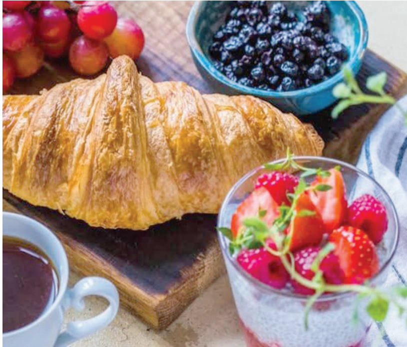
يستخدم الشيف المصري حشواً من الفواكه الطبيعية (الشرق الأوسط)

تحقيق حلمه. يقول: «كنت أنزل إلى المتاجر والمخابز، وتفاجفتني أنواع مخبوزات مرتفعة السعر، التي يدعي أصحابها أنها (صحية) ومن (دقيق الحبة الكاملة)، ويشتريها العملاء لمجرد أنها ذات لون داكن، بينما هي مصنوعة من الدقيق الأبيض، ويمكن لخبراء الطهي ببساطة تمييزها، بينما للأسف من الصعب اكتشافها من الشخص غير المتخصص».