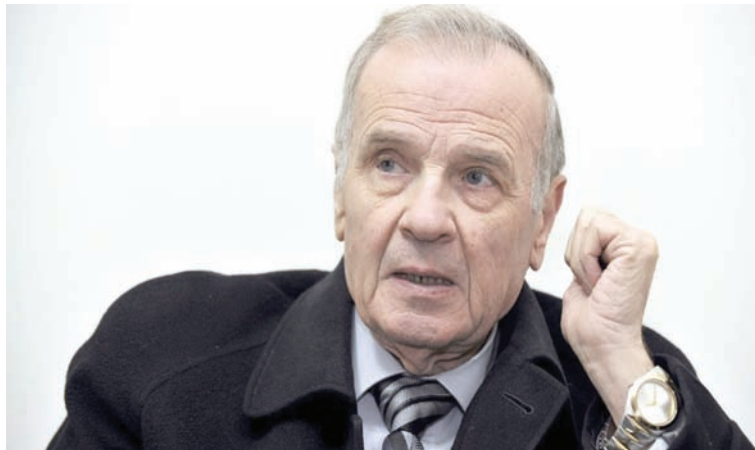
محمد علي شمس الدين

ومن يتتبع تجربة محمود درويش لا بد له أن يلاحظ أنه كان واحداً من أكثر الشعراء العرب احتفاءً بالطفولة، بإبعادها الواقعية والرمزية، فهي لم تعد بالنسبة له مساحة زمنية تقتصر على السنوات الأولى من الحياة فحسب، بل هي خزان الذكريات، بقدر ما هي خط التماس اليومي مع طراوة العيش وبراءة اللغة وصفاء النظرة إلى العالم. وهي قهوة الأم وجغرافيا الروائح التي لا تتفد، ويرغم الحنين إلى الماضي الذي يجبر في داخله يوماً على صدر يوم، ومع تحوّل الحنين في الحالة الفلسطينية إلى شكل من أشكال المقاومة والدفاع عن الهوية الجمعية، فقد رأى درويش أن سعي جنود الاحتلال إلى قتل محمد الدرة، اللائذ دون جدوى بجسد أبيه،