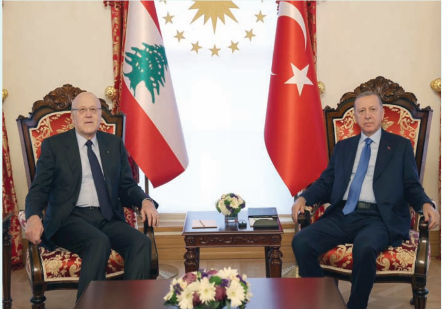
الرئيس التركي مستقبلاً رئيس الوزراء اللبناني