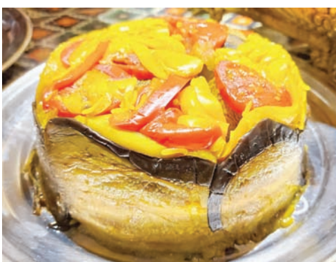
المقلوبة الفلسطينية (الشرق الأوسط)