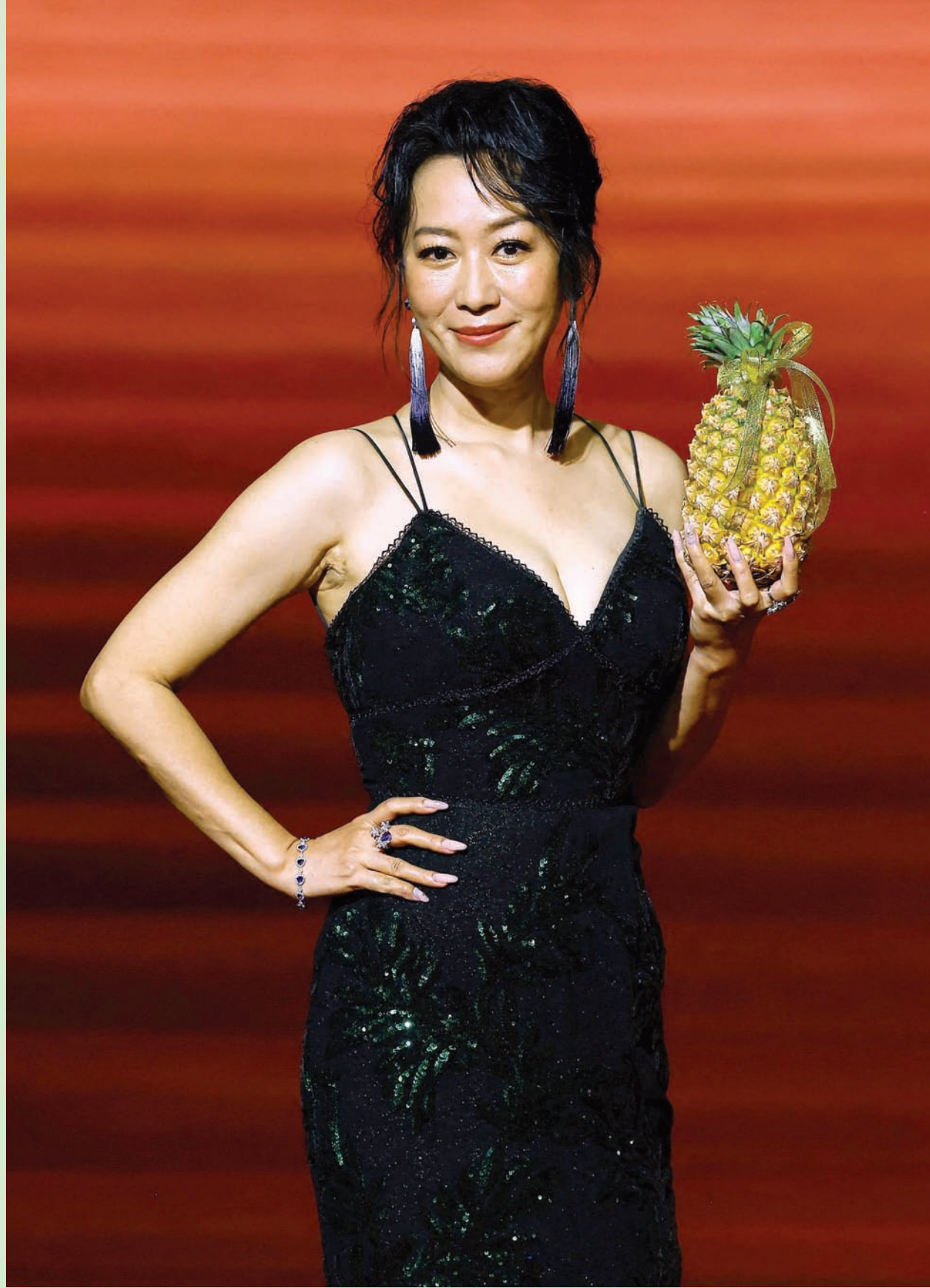
الممثلة لينغ هو لدى حضورها حفل توزيع جوائز «الحصان الذهبي» 60 في تايبيه بتايوان

عموماً السعودية الخضراء هي مبادرة أعلن عنها ولي العهد الأمير محمد بن سلمان في 27 مارس (آذار) 2021. وتهدف لرفع الغطاء النباتي، وتقليل انبعاثات الكربون، ومكافحة التلوث وتدهور الأراضي، والحفاظ على الحياة البحرية.