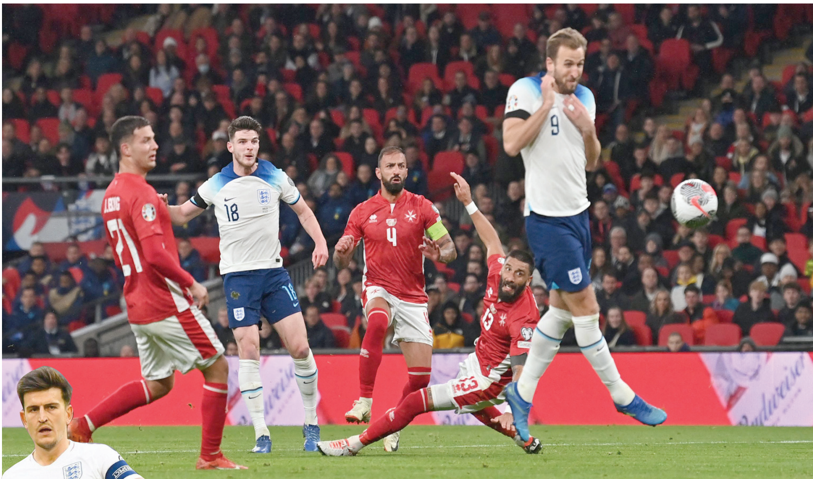
المواجهة الأخيرة مع مالطا أكدت نقطة ضعف المنتخب الإنجليزي (أ.ف.ب)

وفي مباراة إنجلترا ضد أستراليا الشهر الماضي، كان لدينا ظهير أيسر جديد آخر، الذي كان في هذه الحالة لاعب خط وسط يُدعى ليفي كولويل؛ نقل لاعبو أستراليا الكرة نحو الجهة اليمنى، حيث كان كولويل يقف بمفرده ولم يحصل على الدعم الدفاعي اللازم من زملائه، وهو الأمر الذي ساعد مارتين بويل على تمرير كرة عرضية إلى ميتشل ديوك، الذي أهدر واحدة من أخطر فرص أستراليا في المباراة. وفي مباراة إنجلترا ضد إيطاليا بعد ذلك بأيام قليلة، عاد تريبيير مرة أخرى للعب في مركز الظهير الأيسر. نجح تريبيير في إيقاف دومينيكو بيرباردي، ولكن نظراً لأن وضعية جسم جيوفاني دي لورينزو وهو يركض من خلفه، مر بيرباردي الكرة إلى دي لورينزو الذي صنع الهدف لجيانلوكا سكاماك.