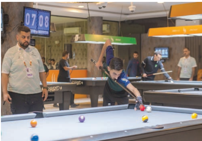
البلياردو شهدت ختام الدور الـ32 أمس