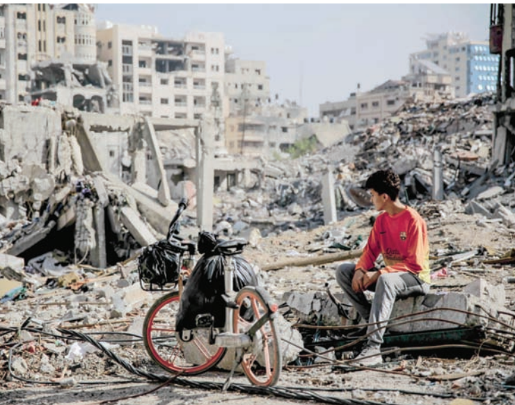
سكان من مدينة غزة يستقلون الهدنة للنزوح جنوباً