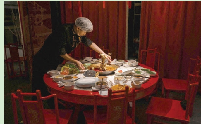
يشكّل طبق «الفونديو» مفخرة مطبخ مطاعم شينغدو في الصين

وذكرت «وكالة الصحافة الفرنسية» أن مطاعم شينغدو، عاصمة مقاطعة سيتشوان (جنوب غربي الصين) التي يشكّل طبق «الفونديو» مفخرة مطبخها، تنتج سنوياً نحو 150 ألف طن من المخلفات المتألفة من هذا السائل الأصفر الدهني. تتلقف شركة «جينشانغ» المحلية هذا السائل، فتهالجه وتحقّق منه كسباً كبيراً، إذ تُصنّره بعد تصفيته لاستخدامه وقوداً في قطاع الطيران. وهي تنتج سنوياً نحو 150 ألف طن من الزيت ذي النوعية الصناعية، بواسطة الدهون المتجمّعة في الزيت المستخدم في «الفونديو»، وأيضاً من زيوت مطاعم أخرى في شينغدو، مثل شبكة «كاي إف سي» لوجبات الدجاج السريعة.