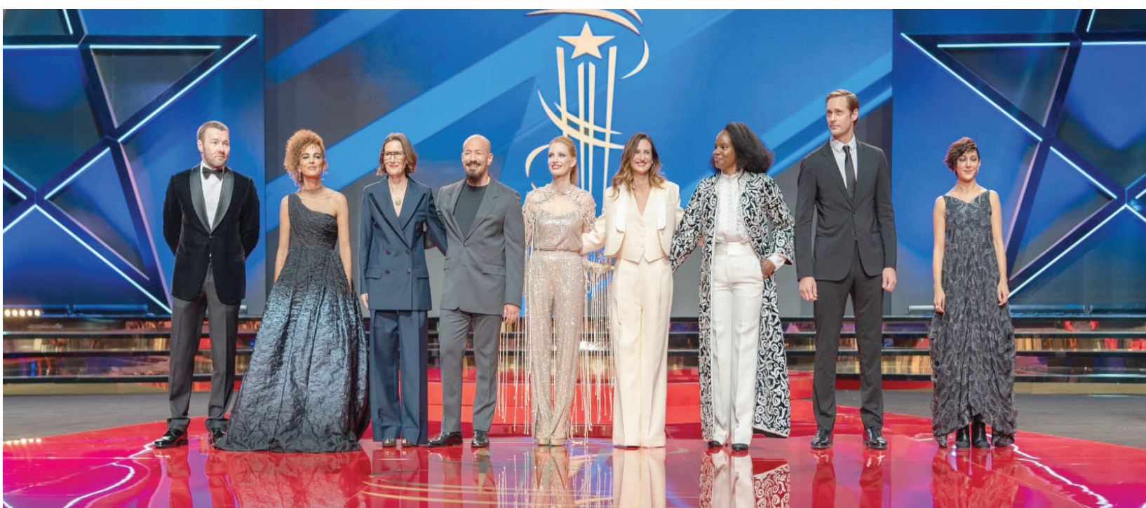
لجنة التحكيم المؤلفة من أسماء عالمية برئاسة الأميركية جيسكا شاستين (الجهة المنظمة)

إلى برنامج العروض السينمائية، تُقدم فقرة «حوار مع...» فرصة لقاء أهم الأسماء في السينما العالمية، من خلال استضافة 11 شخصية تخوض نقاش الممارسة المهنية، والتجارب. تضم القائمتة: المخرجة اليابانية نعومي كاواسي، والممثل الدنماركي مادس ميكلسن، والممثل والمخرج الأمريكي - الدنماركي فيجو موريتسن، والممثلة الأسكتلندية تيلدا سوينتون، والمخرج وكاتب السيناريو الروسي أندري زفياجينتسيف، والممثل والمخرج الأسترالي سيون بيكر، والممثل والمخرج الأمريكي مات ديلون، والمخرج المغربي فوزي بنسعيد، والمخرج الفرنسي بتراند بونيلو، والممثل الأمريكي ويليام دافو، والمخرج والمنتج الهندي أنوراغ كاشياب.