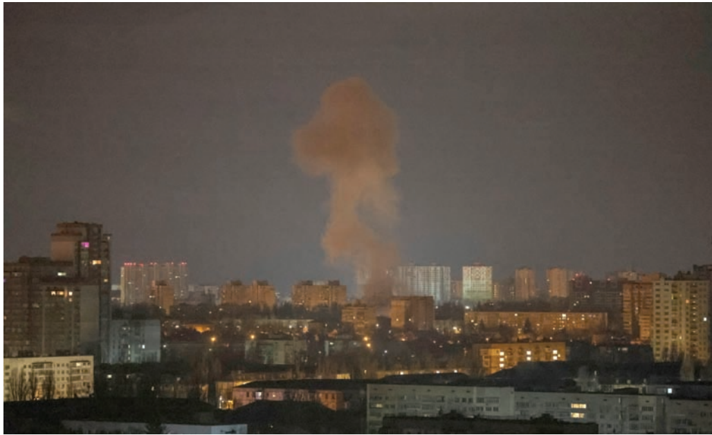
دخان يتصاعد في سماء كييف بعد غارة روسية بمسيرات

للهجوم انقطع التيار عن 120 منشأة في وسط العاصمة، مؤكدة أن أعمال الصيانة جارية.