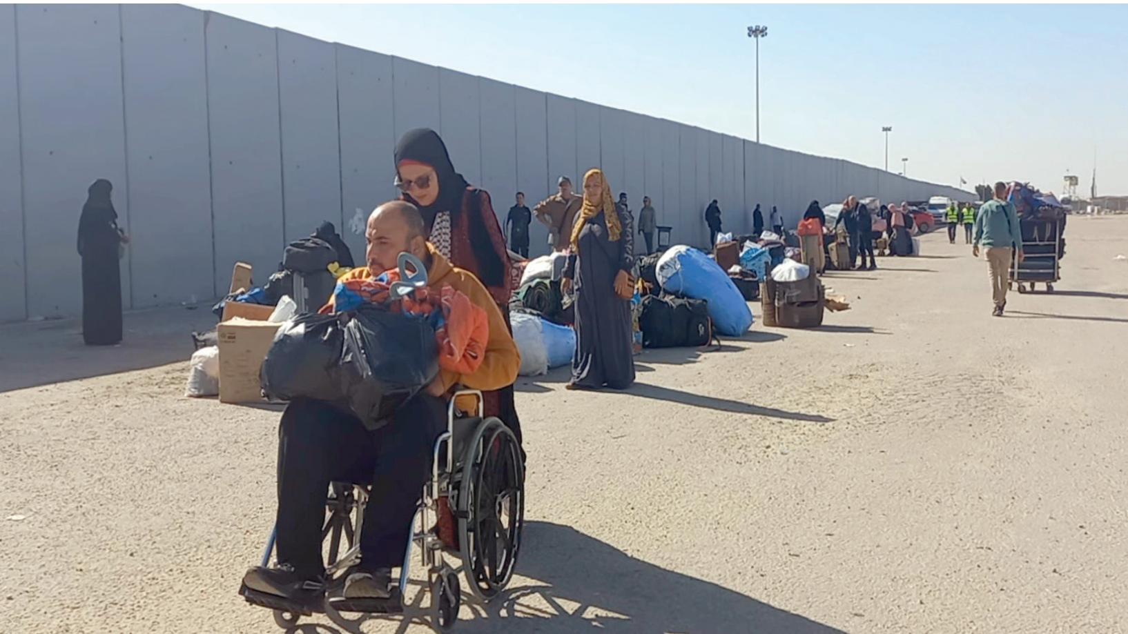
أيمن هنية وزوجته في طريقهما للمرور من المعبر إلى غزة (الشرق الأوسط)

خصصتها محافظة شمال سيناء لإقامة «العالقين» في حي السبيل بالعريش، لحظة، وكأنه شرد في حاله وحال الفلسطينيين قبل يوم 7 أكتوبر الماضي، ثم عاد ليؤكد هدوء وسلام بعيداً عن الحروب والقصف والقتل والتخريب». عطية قال لـ «الشرق الأوسط» قبل مغادرته رفح إن «مشاهد القتل وأشلاء الضحايا في القطاع لا تفارقني، ولا أعلم عندما أعود هل سأجد أهلي وأصدقائي أم لا».