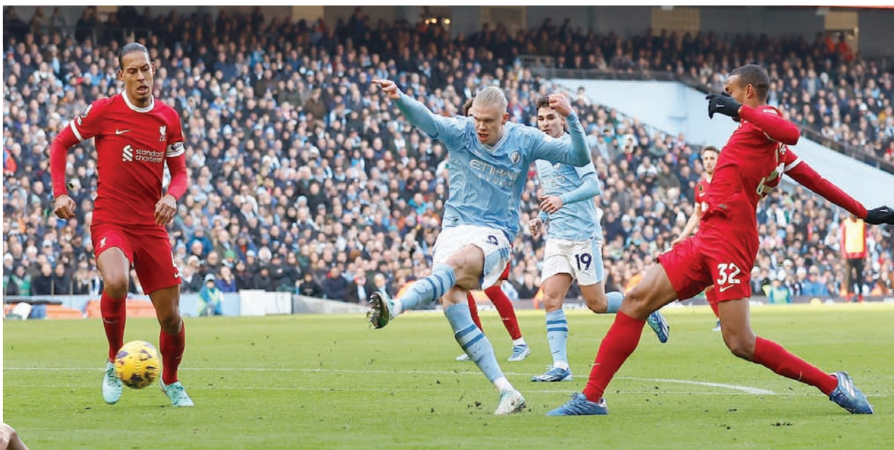
هالاند يهز شباك ليفربول ويحقق رقماً قياسياً آخر في الدوري الإنجليزي

وأبدى المدرب الألماني ليفربول يورغن كلوب استياءه بخصوص إقامة