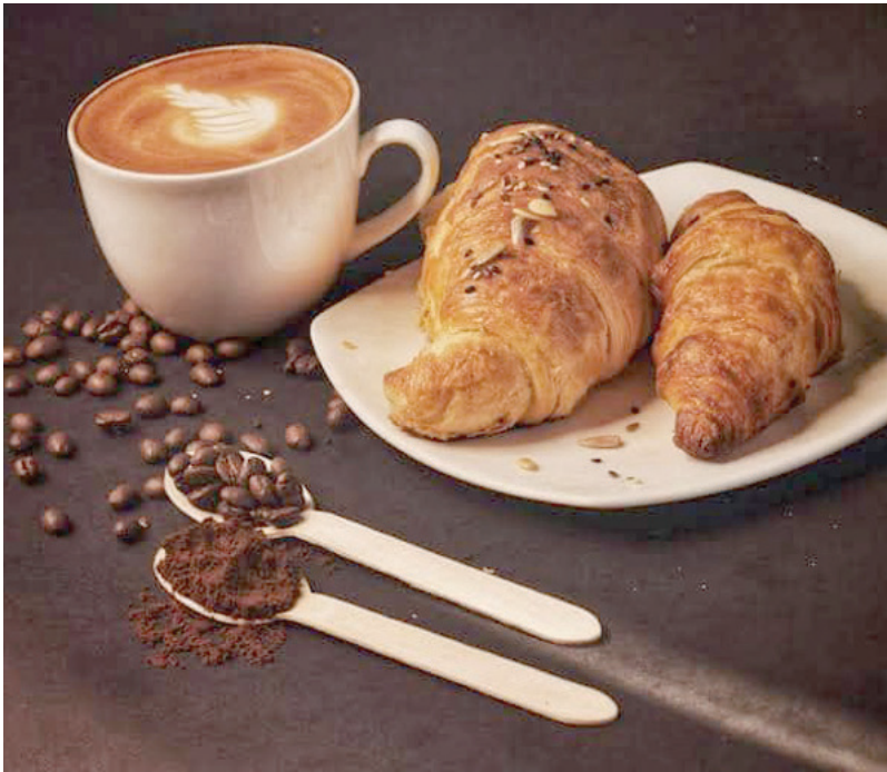
كرواسون محشو بالإسبرسو والكاكاو والعسل والشوكولاته الداكنة