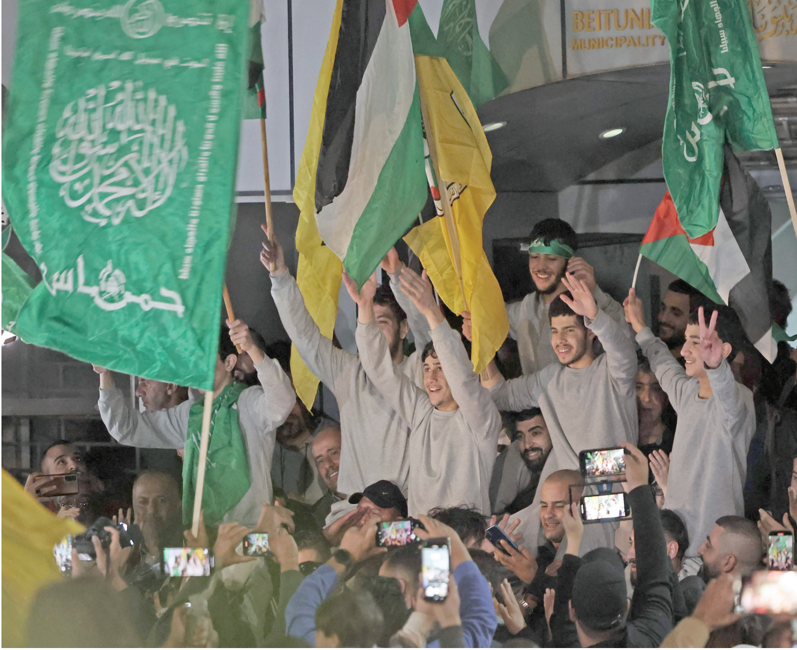
أسرى محررون في بيتونيا قرب رام الله مساء الجمعة (أ.ف.ب)

وجاء ذلك في ظل مؤشرات وجاهة الحرب الإسرائيلية للقضاء على «حماس» في قطاع غزة أدت، كما يبدو، إلى زيادة في شعبيتها في الضفة الغربية، فقبالة مخيم