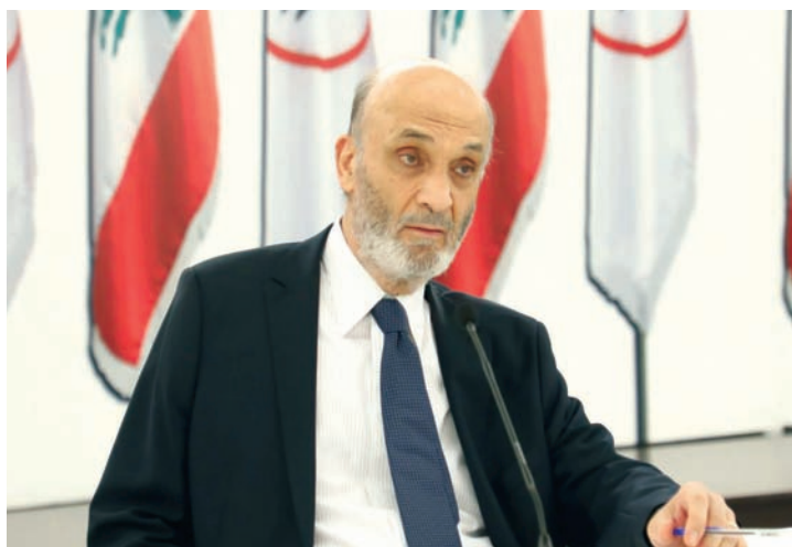
رئيس «القوات اللبنانية» سمير جعجع

وكان عضو كتلة «تجدد» النائب اشرف ريفي، لفت إلى «أننا، كلبنانيين، موحدون؛ مسيحيين ومسلمين لبناء وطن يشبهنا ولا يشبه الآخر، وطن لا يوصف بحقل إرهابي أو مصنع (كبتاغون)، بل يشبه أمين معلوف، نجاح سلام، فيروز، فيليب سالم، يوسف قمبر... ولا يعتقد الفريق الآخر، ولو مرة، أن كرامتنا بدأت مع مقاومته، بل ولدت منذ التاريخ إلى جانب السيادة وأراس مرفوع»، وشدد ريفي على أن «التغيير بدأ حتى في البيئة التي يسيطر عليها المشروع الإيراني، فأصواتنا العالية أعطت أملاً للناس، ونقأؤنا واقعي وليس وهمياً»، أملاً أن تصل إلى انتخاب رئيس جديد للجمهورية سيادي فيسجل التاريخ الانتصار الأول للمشروع الآخر.