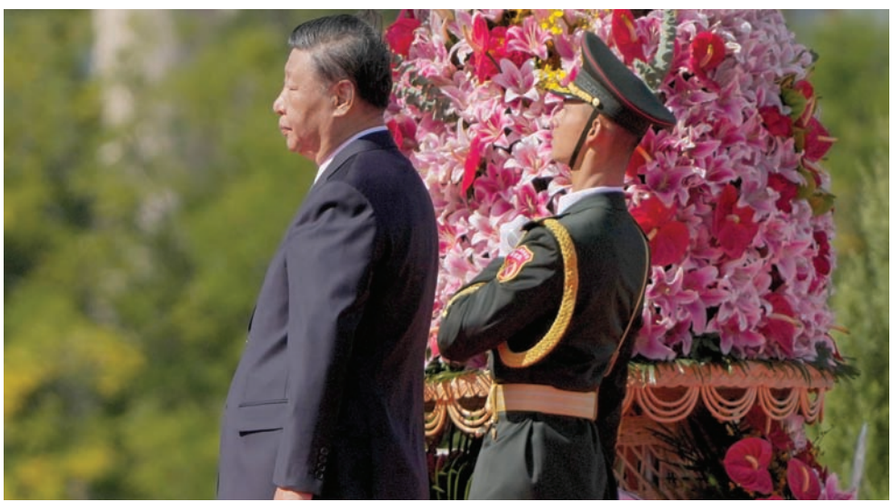
الرئيس شي جينبينغ خلال مشاركته في الذكرى العاشرة ليوم الشهداء في بكين أمس

المحلي المتباطئ، ورأى أن مقارنة الصين في مجال المعلومات المغلوطة تشمل الترويج لـ«الاستبداد الرقمي» واستغلال المنظمات الدولية وفرض السيطرة على وسائل الإعلام الناطقة بالصينية. وذكرت وزارة الخارجية الأميركية في التقرير الصادر يوم