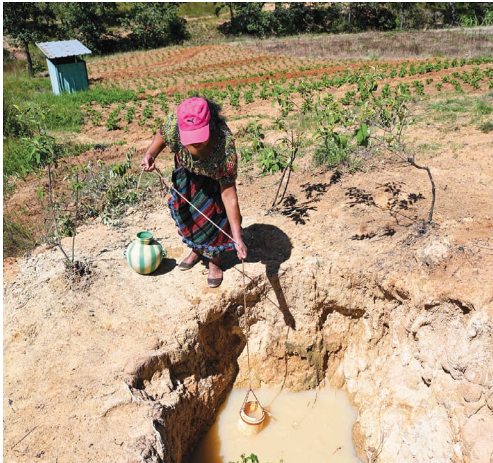
الجفاف يهدد غواتيمالا بأزمة غذائية غير مسبوقه (أ.ف.ب)

وإدراكاً منها لأزمة المياه العالمية التي تلوح في الأفق، عقدت الأمم المتحدة مؤتمراً للمياه في نيويورك في شهر مارس (آذار) الماضي، وهو المؤتمر الثاني فقط في تاريخها عن الموضوع. وكان المؤتمر الأول قد انعقد عام 1977، وفيه اتفقت 118 دولة على ضرورة توفير إمدادات شاملة من المياه وخدمات الصرف الصحي بحلول 1990، وهو هدف لا يزال بعيداً. والأسوأ من ذلك أن المشكلة لم