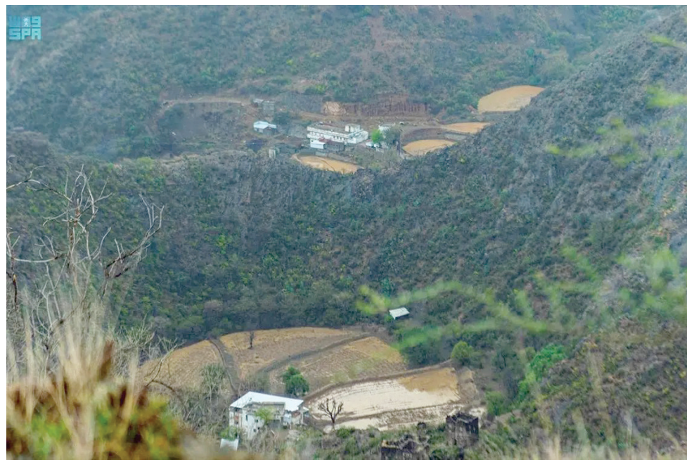
السعودية تستعرض مبادراتها المناخية وتقدمها في مجال خفض الانبعاثات

هذا وقد وسعت نقابة عمال السيارات إضرابها المنسق ضد شركات