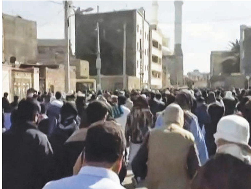
مسيرة منددة بالنظام في مدينة زاهدان

طالبت منظمات حقوقية يوم السبت بمحاسبة السلطات الإيرانية مع مرور عام على مقتل عشرات المحتجين في مدينة زاهدان في جنوب شرقي البلاد، متهمه قوات الأمن باستخدام القوة في مواجهة تحركات شهدتها المدينة الجمعة لإحياء الذكرى واتهم ناشطون قوات الأمن باستخدام الرصاص الحي لتفريق محتجين في مدينة زاهدان، مركز محافظة سيستان - بلوشستان، في 30 سبتمبر (أيلول) 2022. ووفق منظمة «حقوق الإنسان في إيران» ومقرها في النرويج، قضى 104 أشخاص على الأقل في ذلك اليوم الذي اصطلح على تسميته «الجمعة الدامية».