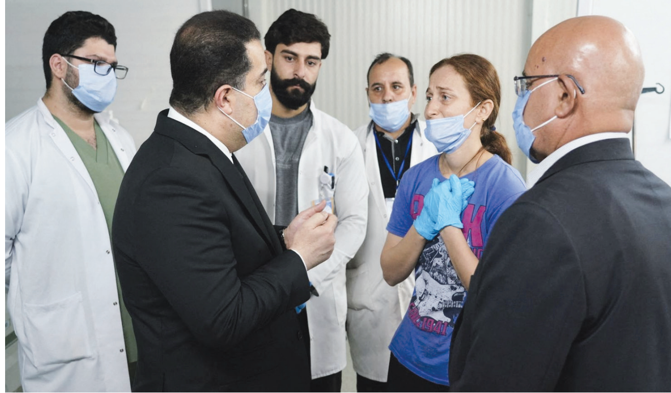
السوداني يتحدث إلى طاقم طبي في مستشفى الحمدانية بعد الحريق المميت

كارثة قاعة «الهيثم» في قضاء الحمدانية بمحافظة نينوى التي أودت بحياة ما لا يقل عن 100 شخص وما زالت جثامين 38 شخصاً مجهولة في انتظار فحوصات الحمض النووي، فضلاً عن عشرات المصابين الذين نقل عدد صغير منهم للعلاج في تركيا. هذه الكارثة مثلت نزوة ما عرف بـ«أعراس الدم» التي اختبرها العراقيون بمرارة وحزن شديدين خلال الأسبوع الأخير. في اليوم التالي من كارثة عرس الحمدانية أعلن عن تسمم أكثر من 100 شخص في عرس مماثل في محافظة صلاح الدين المجاورة، نقل معظمهم إلى المشافي القريبة لتلقي العلاج، ولحسن الحظ لم يسفر الحادث عن وفاة أشخاص رغم تحوّل المناسبة المفجعة إلى مأساة حزينة. وفي اليوم الثالث، وقع حادث سير مروّع في «رقة عرس» آخر في قضاء اليزيدية بمحافظة واسط بجنوب العراق، أودى بحياة 8 أشخاص من أسرة واحدة ليتحول العرس من جديد إلى ماتم