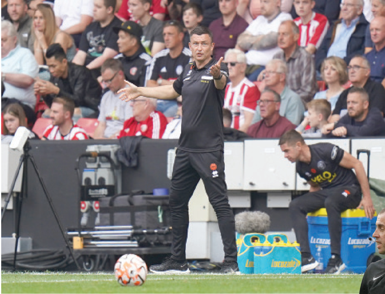
هيكنوتوم مدرب شيفيلد يونايتد اتهم الحكم بعدم فهم اللعبة بعد الهزيمة من توتنهام

ربما كان من الممكن أن يفعل ذلك. لكن ما المشكلة الأساسية هنا؟ عند تنفيذ ركلات المرمى، يجب شيفيلد يونايتد تقسيم لاعبي خط الدفاع وخط الوسط بطريقة معينة، لكن لاعبي توتنهام كانوا يضغطون حتى يجعلوا الأمر أكثر صعوبة، وهو الأمر الذي دفع فودرينغهام إلى التردد في اللعب بسرعة، وهو ما أثار غضب بانكس. لكن إذا كان لاعبو شيفيلد يونايتد يفترقون إلى الخفة أو القدرة على تمرير الكرة بشكل جيد من ركلة المرمى عندما يضغط عليهم لاعبو الفريق المنافس، ربما لا يتعين على شيفيلد يونايتد أن يسعى لبناء الهجمات من الخلف بكرات قصيرة، وقبل كل شيء، يمكن تنفيذ ركلات المرمى بشكل قصير للغاية نظراً لأنه لا يتم السماح لأي لاعب من لاعبي الفريق المنافس بالدخول إلى منطقة الجزاء حتى يتم تنفيذ ركلة المرمى، وهو ما يمنح اللاعب الذي يتسلم التمرية من حارس المرمى مساحة