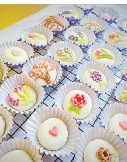
أشكال وتصميمات منمقة