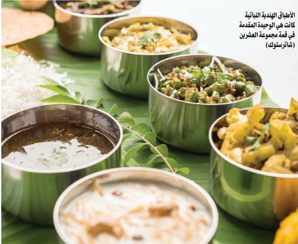
الأطباق الهندية النباتية كانت هي الوحيدة المقدمة في قمة مجموعة العشرين (شانتوكت)

المستشفى والأمراض الصحية يكون أقل لدى الأشخاص النباتيين من أولئك الذين يعتمدون على نظام غذائي للحوم. ووجدت دراسة مماثلة أجراها التحليل العلمي في الولايات المتحدة، أن النظام الغذائي النباتي يرتبط بتقليل المخاطر النسبية لمرض القلب التاجي بنسبة 25 في المائة، وتقليل المخاطر النسبية للسرطان بنسبة 8 في المائة، مع النظام الغذائي النباتي الذي يمنح 15 في المائة الحد من المخاطر النسبية للسرطان. صنفت منظمة الصحة العالمية اللحوم المصنفة على أنها مسببة للسرطان، واللحوم الحمراء (غير