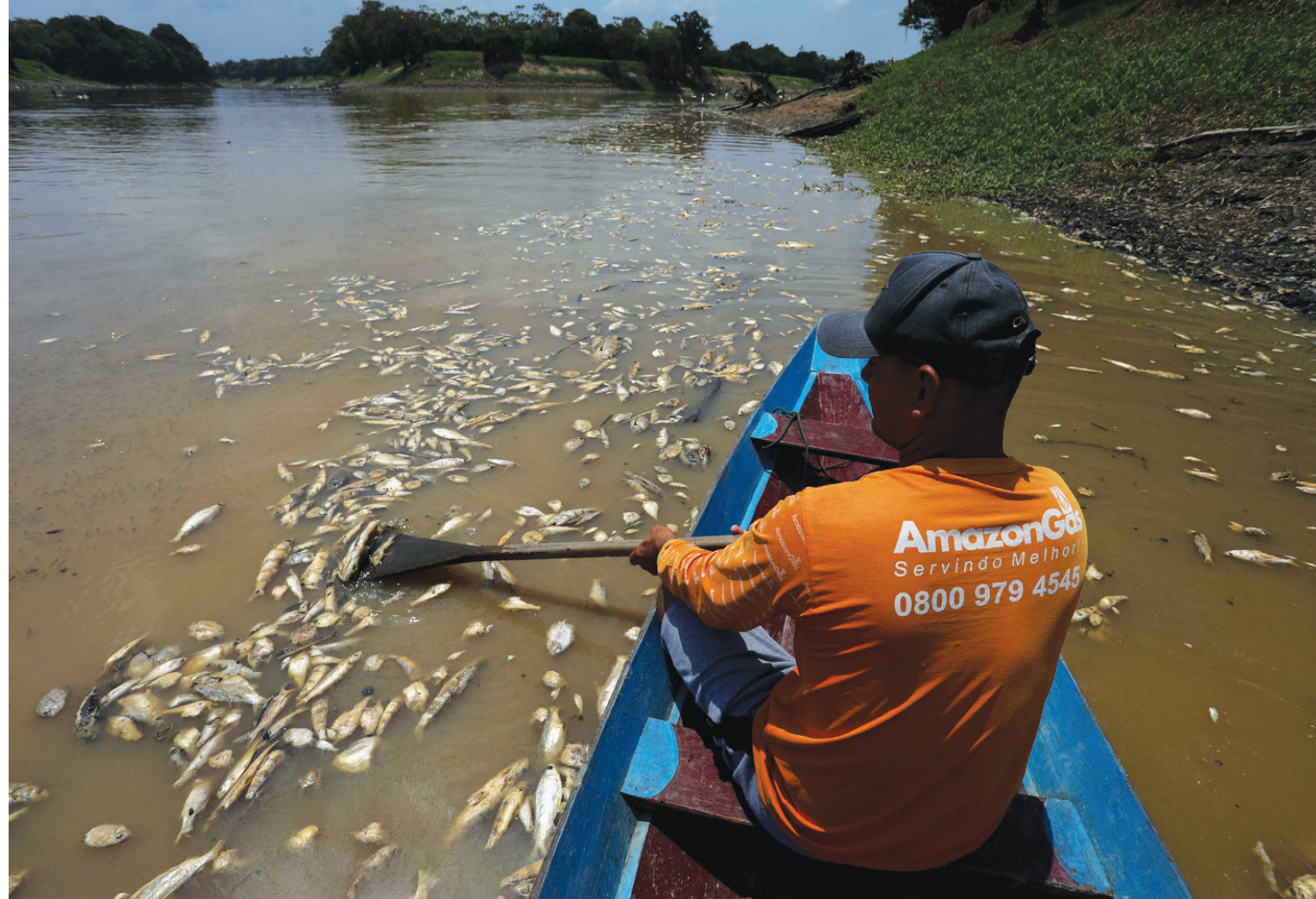
برازيلي يُبحر بزورقه وسط أسماك نافقة بسبب انخفاض مستوى المياه في بحيرة لا دو بيرانها

الدول العربية مسار حتمي، وليست خياراً للدول العربية، بالترافق مع تعاون إقليمي يستفيد من المزايا النسبية التفاضلية لكل بلد عربي. لقد حققت بعض الدول العربية إنجازات كبرى في مجالات التنمية والاستدامة والعمل المناخي، بما فيها برامج ضخمة في الطاقة المتجددة وإدارة المياه والبنى التحتية المتطورة والاقتصاد الأخضر عاملاً. لكن لا بد من تعميم الفوائد على جميع بلدان المنطقة، فلا يتخلف أحد عن الركب، بما يعزز الازدهار ويدعم الاستقرار.