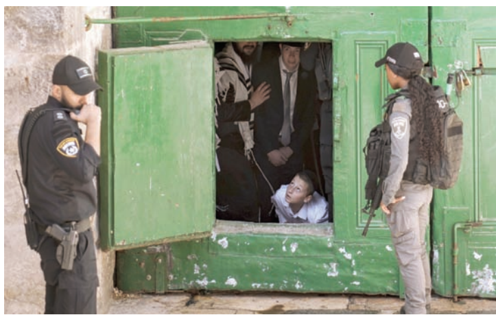
يهود أرثوذكس خلف باب المسجد الأقصى أمس تحت حراسة الشرطة الإسرائيلية خلال عطلة عيد العرش (أ.ب)

جديداً يمتد من ساحة الجراق إلى القصور الأموية الملاصقة للسور الجنوبي للمسجد الأقصى المبارك، بهدف تهويد المنطقة المحيطة بالأقصى، وترويحاً لما يُسمى «الهيكل المزعوم». ويصل طول النفق الجديد إلى نحو 200 متر، وينزل تحت الأرض نحو 15 متراً، ويحتوي متحف يعرض آثار نقول إسرائيل إنه تم العثور عليها خلال الحفريات في القصور الأموية، كما يروج بأن الأقصى كان ممراً للهيكل.