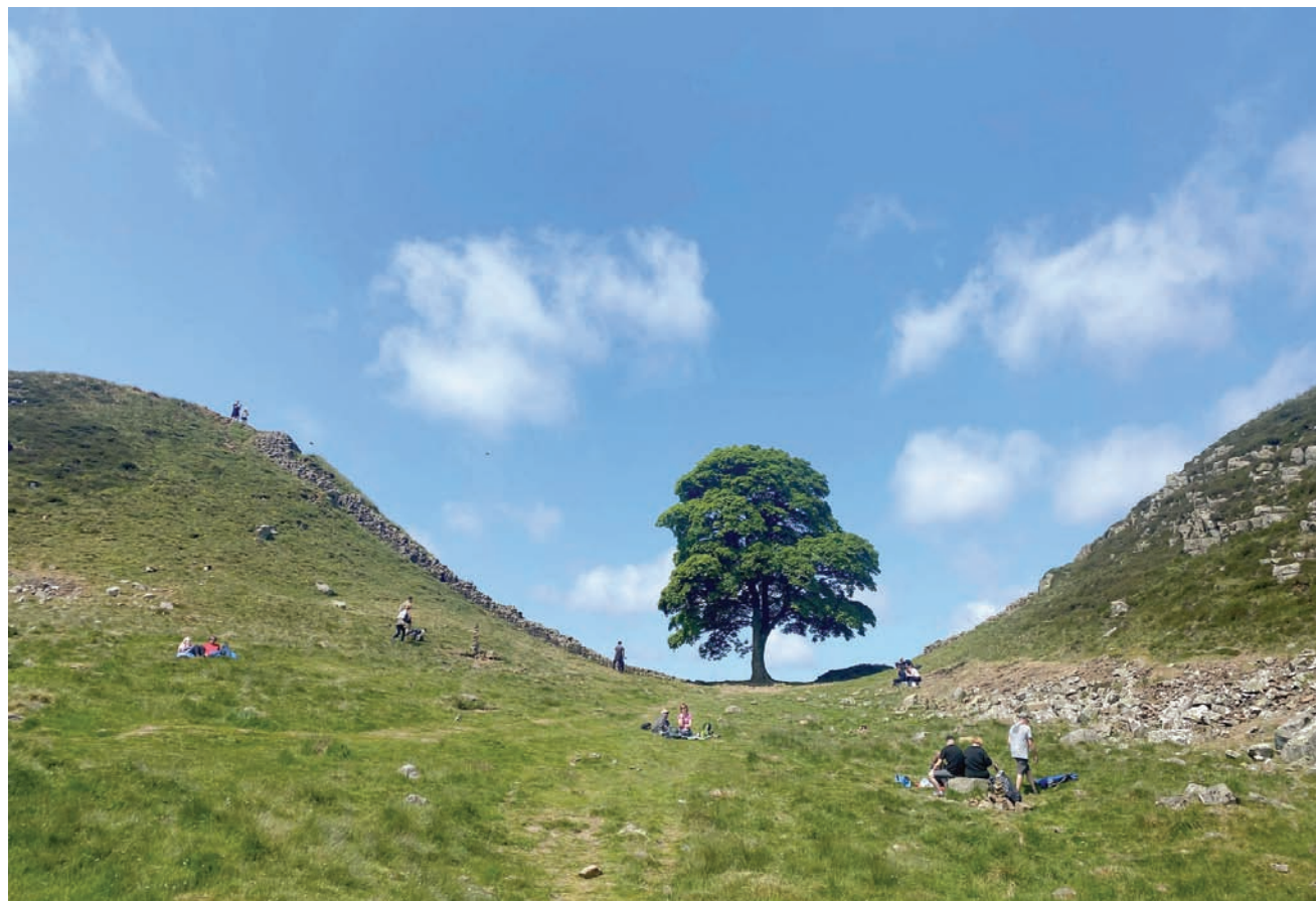
شجرة «سيكامور غاب» كانت معلماً طبيعياً محبوباً في بريطانيا