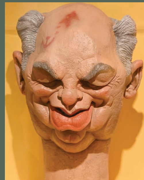
جسد «سبيتينغ إيدج» المسؤولين بطريقة كاريكاتورية (أ.ف.ب)

تستضيف جامعة كامبريدج، ابتداءً من السبت، معرضاً يوحى تحية إلى روح الدعاية اللاذعة التي ميّزت برنامج الدمى البريطاني الساخر «سبيتينغ إيدج» (Spitting Image)، فلهم عدد كبير من الأعمال التلفزيونية المماثلة في مختلف أنحاء العالم، منها «ليه غينبول دو لينفو» (Les Guignols de l'Info) في فرنسا. وجسد «سبيتينغ إيدج» على مدى 12 عاماً، بين 1984 و1996، المسؤولين السياسيين بطريقة كاريكاتورية بواسطة الدمى المتحركة.