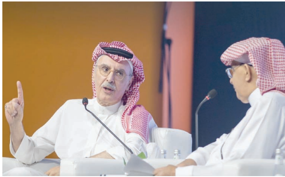
الأمير بدر بن عبد المحسن في الأمسية الحوارية بعنوان: «أسئلة الشعر والفن» على «مسرح الرياض» في معرض الكتاب

علاقته بالنقد، والرسم، واستماته بالكتابة التي رأى أنها وسيلته للشعور بالحياة، لكن الجمهور كان ينتظر منه أن يصاح بالشعر، كعادته، فكان ما توقعوه. حملت الأمسية الحوارية عنوان: «أسئلة الشعر والفن»، وفي بدايتها تساءل الشاعر محمد جبر الحربي، لماذا تغافل النقاد والباحثون عن دراسة التجربة الشعرية لبدر العبد المحسن. كما تساءل عن اختيار البدر لكتابة الشعر باللغة الفصحى، فأكد الأمير الشاعر أنها جاءت بغرض النشر، لكنه ظل على فوائده لكتابة الشعر باللغة العامية، لقناعته بأن «الكتابة بلغة تملكها وتتمكن منها هي الأفضل»، ولأن العامية هي المقربة والمحبة لديه. وقال الأمير بدر، الذي يبلغ من العمر 74 عاماً، إن طموحه في هذا السن «هو الشعور بالحياة»، وأكمل قائلاً: «إن الاستمرار في الكتابة بشكل جسر العصور لهذا الشعور. وأضاف أن كتابة نص أدبي قبل 30 عاماً قد لا يستغرق ليلة أو ليلتين، بينما يستغرق اليوم