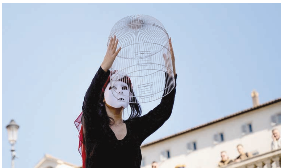
إيرانية ترفع خلال وقفة احتجاجية سابقة قفصاً يرمز إلى السجناء في إيران