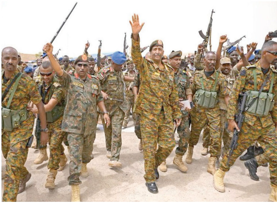
البرهان خلال جولة بقاعدة «فلامنغو» البحرية في بورسودان أغسطس الماضي

أكد رئيس مجلس السيادة، قائد الجيش السوداني، عبد الفتاح البرهان، يوم السبت، أن القوات المسلحة مستقلة ولا تخضع لأي إملاءات من أي جهة، وأثناء ذلك قتل ما لا يقل عن 7 أشخاص وأصيب العشرات من المدنيين في قصف جوي ومدفعي متبادل في العاصمة الخرطوم. ويأتي حديث البرهان بعد يومين من فرض واشنطن عقوبات على القيادي الإخواني في النظام المعزول، علي أحمد كرتي، لإعاقته جهود الانتقال الديمقراطي في البلاد. واجتمع البرهان في مقر سلاح المدفعية بمدينة عطبرة بولاية نهر النيل شمال البلاد، بحاكم الولاية، محمد البدوي عبد الماجد، وأعضاء اللجنة الأمنية وقيادات الشرطة وقيادات العمل التحفيدي بالولاية، سبقه بقاء تنويري مع ضباط برتب مختلفة بسلاح المدفعية، وفق بيان لشرطة الولاية. ووصل البرهان إلى الولاية، الجمعة، وهي الثانية له بعد خروجه من مقر القيادة العامة للجيش في العاصمة الخرطوم في 25 أغسطس (آب) الماضي.