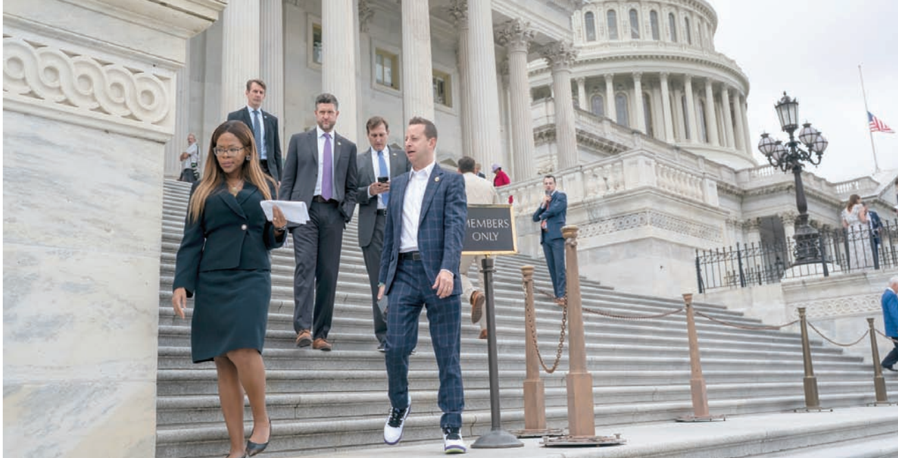
مشروعون بغادرين الكابيتول بعد انهيار معادئات تجنب الإغلاق الحكومي الجمعة

بالتفشل، جزئياً، لأن مجموعة من النواب اليمينيين المتطرفين، الذين يتحكمون في إمكانية عزله، في ظل هامش الغالبية الضيقة التي يحظى بها الجمهوريون في مجلس النواب، يواصلون تغيير مطالبهم الخاصة. ومع نفاذ الوقت منتصف الليل السبت -الأحد، على بداية الإغلاق، بدأ أن التشريعين عالقون في دوامة.