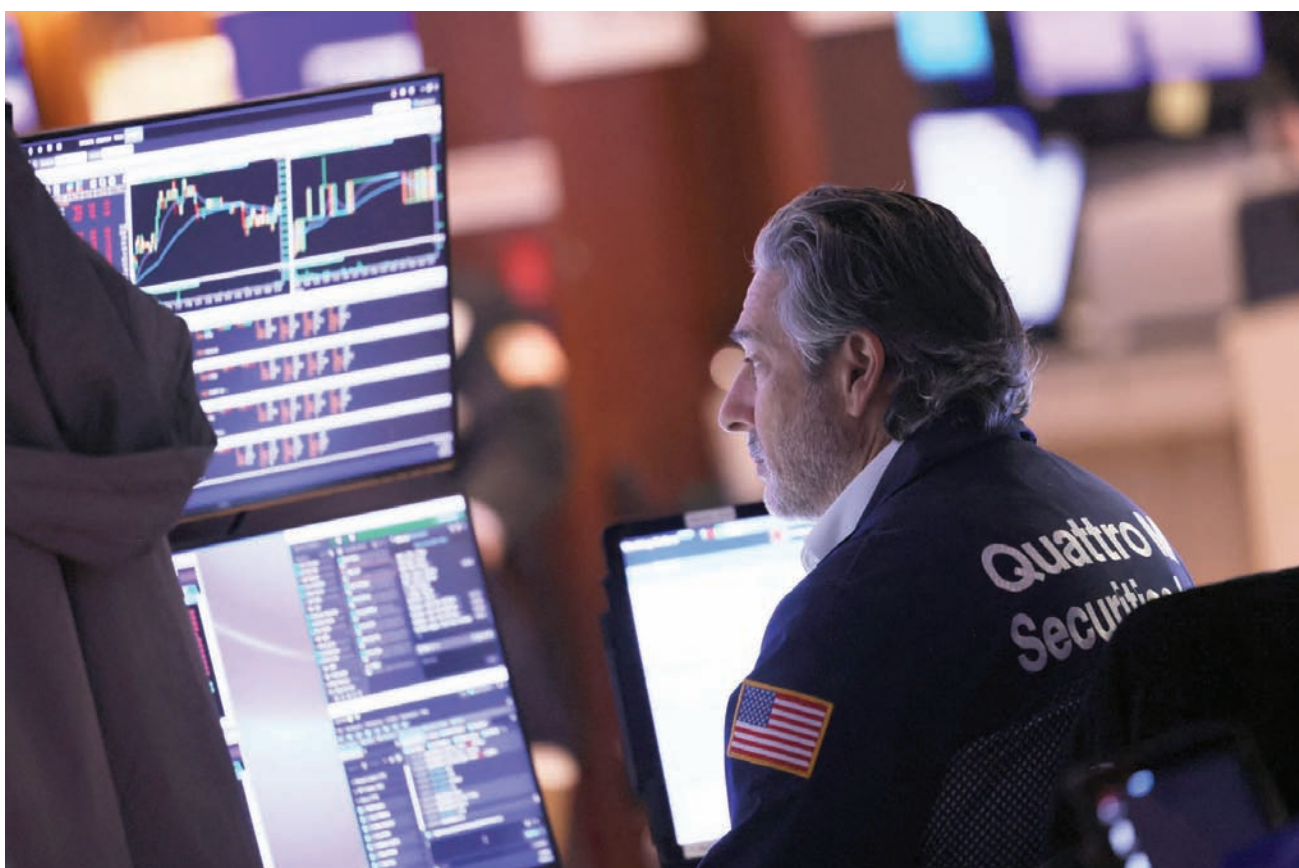
تتعامل في بورصة نيويورك يراقب تطور الأسعار بعد صدور أسعار نفقات الاستهلاك الشخصي

خلال زيارتها لمدينة سافانا، جورجيا، سال الصحافيون يلين عن تقارير تشير إلى اقتراب أسعار النفط الروسي في الفترة الحالية