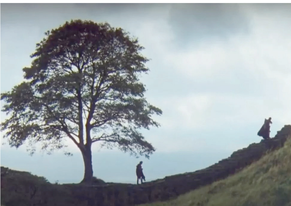
لقطة من فيلم «روبن هود» وتبدو فيه شجرة «سيكامور غاب»