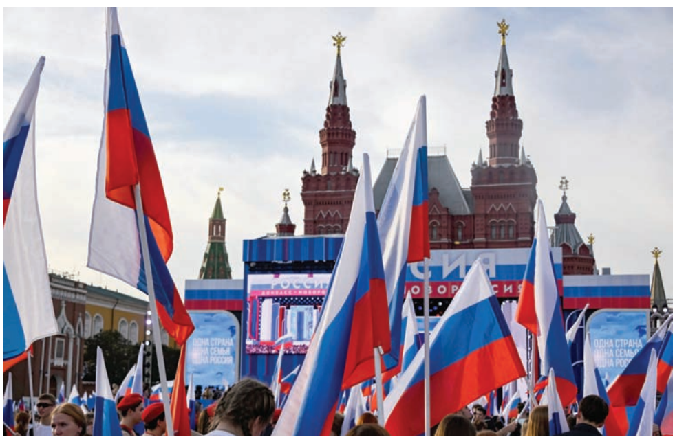
الاحتفالات في الساحة الحمراء في الذكرى الأولى لضم المناطق الأوكرانية (أ.ف.ب)

«النصر سيكون حليفنا. وستنضم مناطق جديدة إلى روسيا». وصدوره، قال الرئيس الروسي فلاديمير بوتين في وقت مبكر السبت، إن سكان المناطق التي تسيطر عليها موسكو في أوكرانيا عبروا عن رغبتهم في أن يكونوا جزءاً من روسيا في الانتخابات المحلية التي أجريت في الأونة الأخيرة، مؤكداً مجدداً الاستفتاءات التي أجريت العام الماضي والتي رفضتها الأغلبية الساحقة لدول العالم واعتبرتها منافية للقانون الدولي. ورفضت الدول الغربية النتائج بوصفها ضمًا لا معنى له وغير قانوني، مدعوماً بالتهديد الجماعي للناخبين. ولا تسيطر القوات الروسية على أي من هذه المناطق بشكل كامل. وفي خطاب مصور صدر في الذكرى السنوية الأولى لإعلان روسيا الكثير للحد من الضم، قال بوتين إن خيار الانضمام إلى روسيا تعزز من خلال الانتخابات المحلية التي جرت هذا الشهر والتي أعادت مسؤولين يدعمون الانضمام إلى روسيا. وأضاف «تماماً كما حدث قبل عام في الاستفتاءات التاريخية، عبر الناس