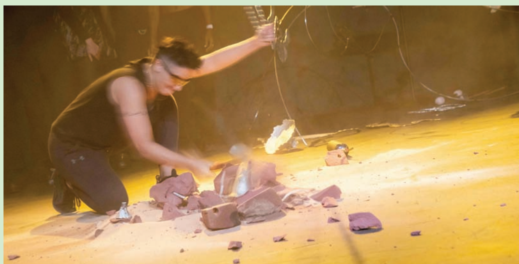
في الفصل الأخير من العرض تأتي النغمات مباشرة من الآلات المعدنية والصنوج (أ.ف.ب)