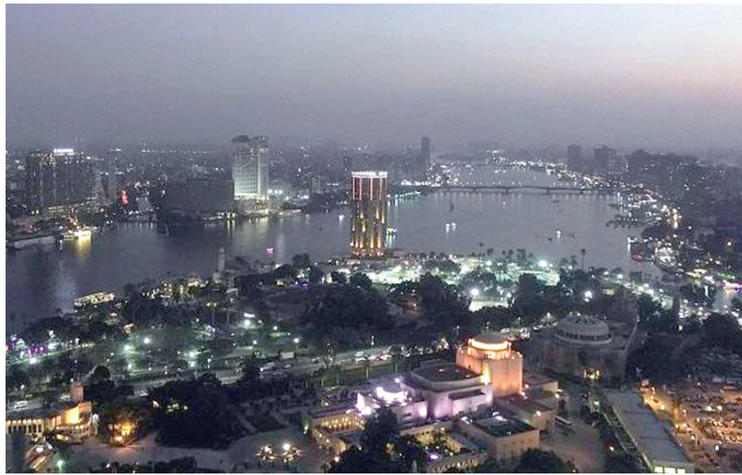
نهر النيل وسط العاصمة المصرية القاهرة

ويهدف المشروع إلى ازدواج القطاع الجنوبي للقناة بطول 10 كيلومترات