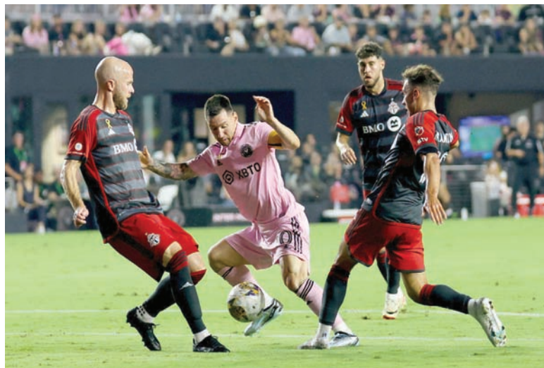
متابعة ميسي في ميامي أصبحت باهظة الثمن

في الواقع، استفاد البعض من تذكّره الموسمية لبعض تذاكر المباريات بأسعار مرتفعة في السوق الموازية. وسيكون متاحاً للمشجعين تخفيض قيمات مقاعدهم بحال رغبوا في ذلك، وقال مصدر في النادي إن لائحة الانتظار طويلة للحصول على التذاكر الموسمية. ويخوض إنتر ميامي الموسم الرابع