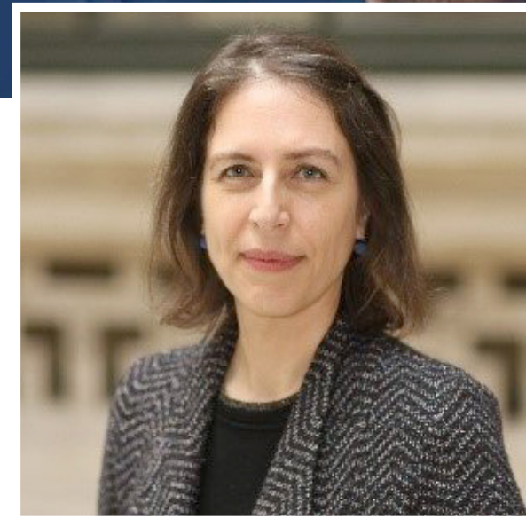
المبعوثة البريطانية لسوريا آن سنو (حساب شخصي)

بالاحتجاجات، «صعب الأمر» على دمشق التي لا تزال تظهر تجاهلها للحراك. وتتابع المصادر أن دمشق لن توفر جهداً في محاولة تفكيك الحراك من الداخل، بدلاً عن استخدام القوة التي تبدو حتى اليوم مستبعدة عن قائمة الحلول، كما هو مستبعد أيضاً التفاوض مع الحراك. وأظهرت النسخة التي بثها التلفزيون الرسمي السوري لمقابلة الرئيس الأسد مع تلفزيون الصين المركزي (CCTV)، تجنب المذيع الإشارة إلى الاحتجاجات في السويداء، بل إن الأسد، ورداً على سؤال عن اللحظات الصعبة التي عاشها خلال الحرب، أكد أن الذي ساعده على الصمود هو وقوف الشعب معه.