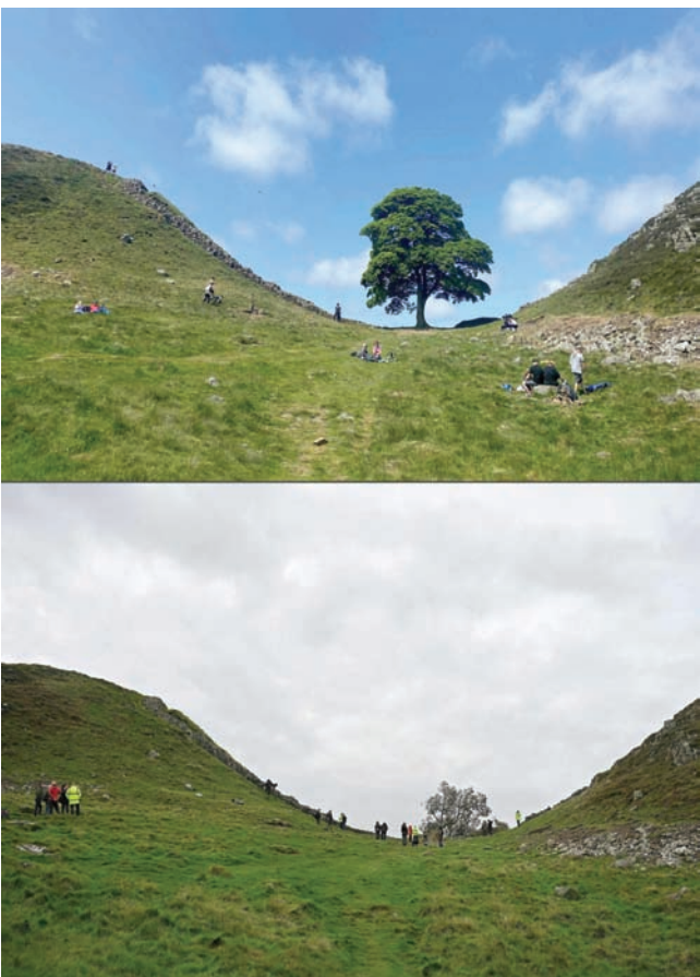
صورة مركبة لموقع شجرة «سيكامور غاب» قبل وبعد الجريمة