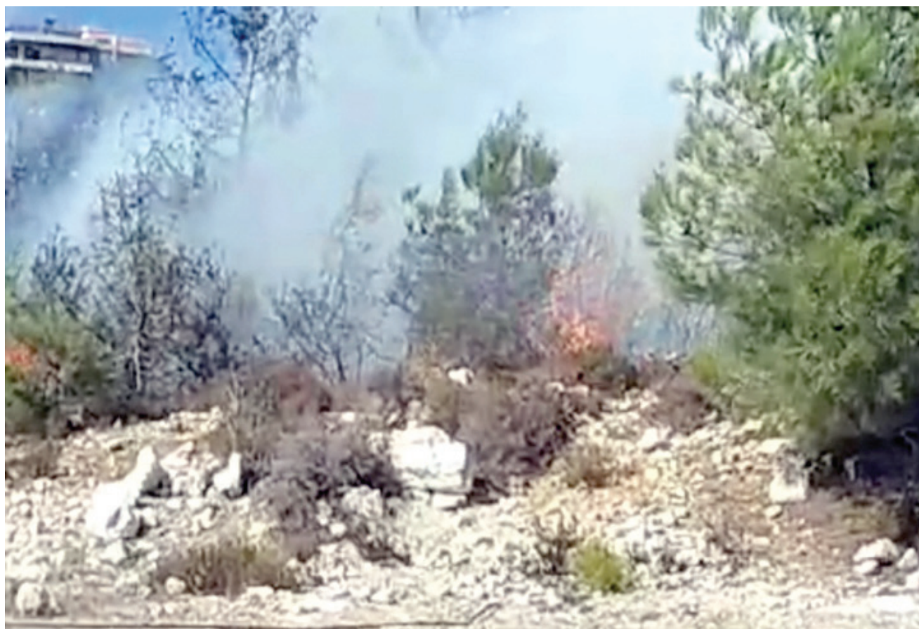
حرائق التهمت أحراش الصنوبر في جبل لبنان قبل إخمادها مساء أمس

يلجأ القرويون إلى إحراق مخلفات الأعشاب بعد تنظيف بسايتهم، ما يشير إلى أن معظم الحرائق «تندلع نتيجة إهمال غير متعمد» وفق وزير البيئة