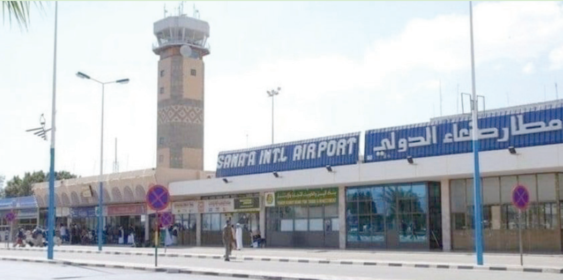
تواجه «طيران اليمنية» كثيراً من الصعوبات والمعوقات في صنعاء