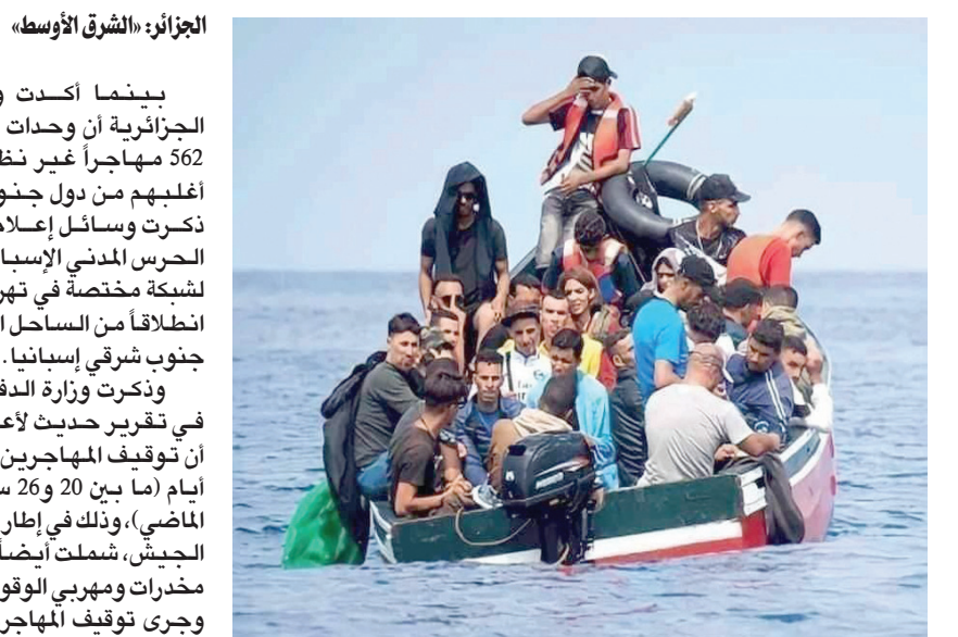
صورة أرشيفية لمهاجرين جزائريين في البحر المتوسط (الشرق الأوسط)