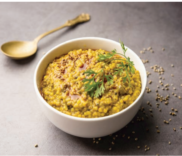
الدخن دخل في معظم الأطباق التي قدمت على موائد الرؤساء في الهند (شانتوكت)

المستشفى والأمراض الصحية يكون أقل لدى الأشخاص النباتيين من أولئك الذين يعتمدون على نظام غذائي للحوم. ووجدت دراسة مماثلة أجراها التحليل العلمي في الولايات المتحدة، أن النظام الغذائي النباتي يرتبط بتقليل المخاطر النسبية لمرض القلب التاجي بنسبة 25 في المائة، وتقليل المخاطر النسبية للسرطان بنسبة 8 في المائة، مع النظام الغذائي النباتي الذي يمنح 15 في المائة الحد من المخاطر النسبية للسرطان. صنفت منظمة الصحة العالمية اللحوم المصنفة على أنها مسببة للسرطان، واللحوم الحمراء (غير