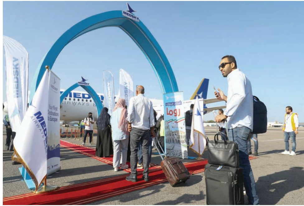
تسيير أول رحلة طيران إلى روما بعد اتفاق بين الطيران الليبي والإيطالي

ورأى صالح أن ليبيا «تحتاج رئيس دولة والاتجاه للانتخابات لأنها هي الحل»، موضحاً أن «حكومة واحدة مصغرة ستكون مهمتها توفير المتطلبات للاتجاه إلى الانتخابات، وتتمتع بإعادة تاهيل المناطق المتضررة... وأزمة ليبيا ككل لن تحلها إلا انتخابات برلمانية». من جهة ثانية، وتعليقاً على تحذير واشنطن للمشير خليفة