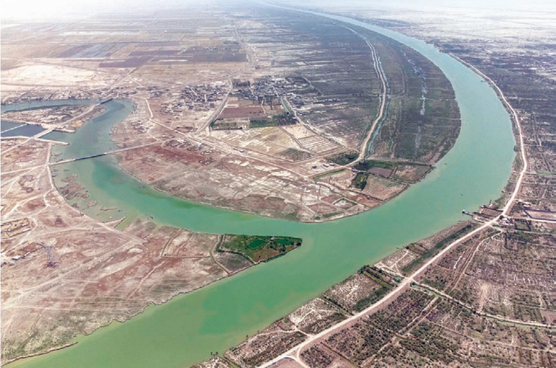
صورة جوية تظهر التقاء نهري دجلة والفرات في البصرة

ورغم التحديات، فإن هناك بعض الحلول للوصول إلى تفاهات حول مياه نهري دجلة والفرات، من بينها التوافق حول بناء مزيد من السدود والخزانات التي تحقق التنمية المستدامة في البلدان الثلاثة، والاستثمار في تدابير الحفاظ على المياه وكفاءتها، ووضع خطة إقليمية لإدارة المياه تعزز الثقة والتعاون. وقد تسهم الضغوط المتزايدة من المجتمع الدولي في الوصول إلى توافقات ترضي الجميع.