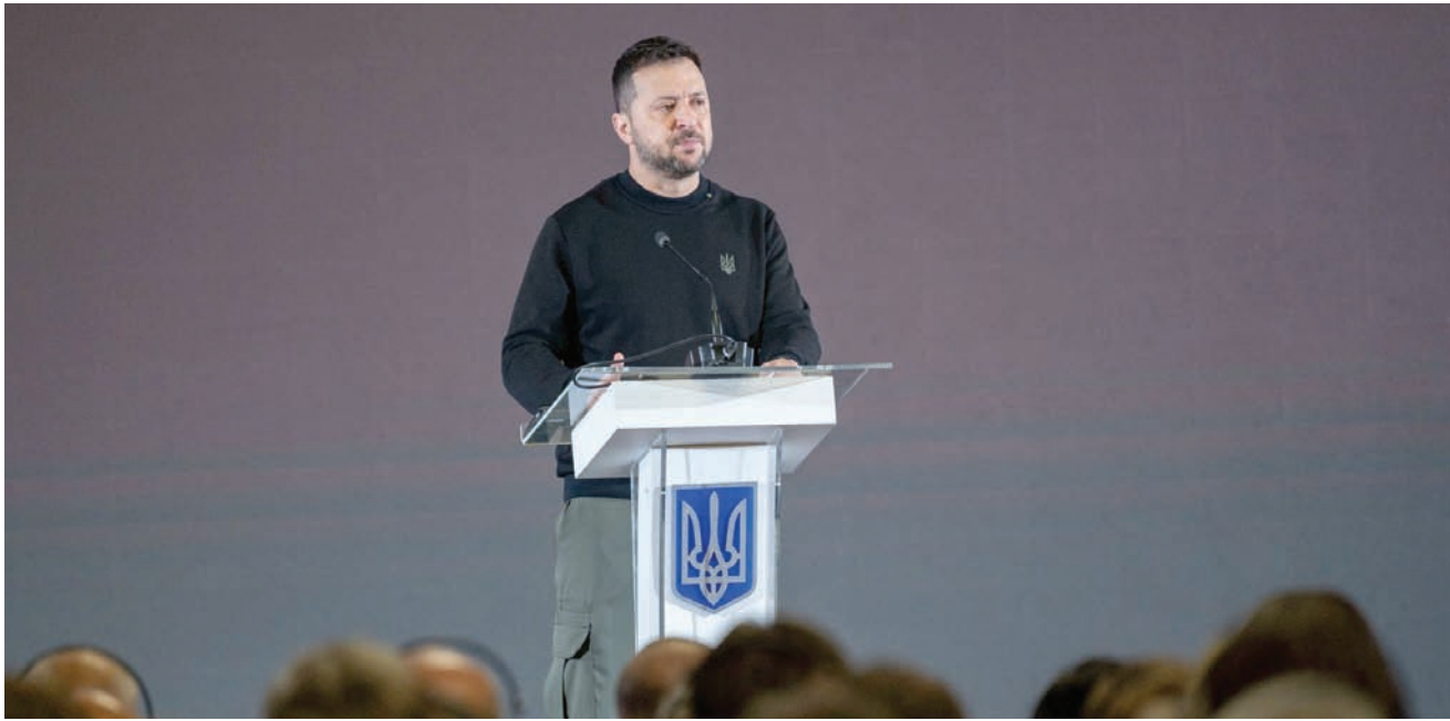
الرئيس الأوكراني فولوديمير زيلينسكي يتحدث في النسخة الأولى من منتدى الصناعات العسكرية الدولية في كييف

ربط الرئيس الأوكراني فولوديمير زيلينسكي السبت، بين الهجوم المضاد الذي أطلقته قواته في يونيو (حزيران) الماضي، لتحرير الأراضي التي احتلتها روسيا منذ فبراير (شباط) الماضي، ومركز تحويل قطاع الدفاع في بلاده إلى «مركز عسكري كبير» بالشراكة مع مصنعي الأسلحة الغربيين ينقل بلده من مستهلك للأسلحة إلى مصدر لها. وقال زيلينسكي خلال افتتاح منتدى الدفاع: «مهمتنا الأولى الانتصار في هذه الحرب، وإعادة السلام المستدام إلى شعبنا، والأهم أن يكون موثوقاً به. سنحقق هذه المهمة بالتعاون معكم». وافتتح الرئيس الأوكراني منتدى كييف الأول للصناعات الدفاعية، في محاولة لاستقطاب مزيد من المجموعات العسكرية لبناء معداتها في بلاده تسهيلاً لمواجهة الغزو الروسي. ومنذ بدء موسكو هجومها العسكري في فبراير 2022، تعول أوكرانيا على المساعدات العسكرية الغربية، وتسعى بشكل كبير إلى تعزيز إنتاج الأسلحة محلياً خشية تراجع الدعم الغربي لها مع مرور الوقت. وقال زيلينسكي لمسؤولين تنفيذيين يمثلون أكثر من 250 شركة غربية منتجة للأسلحة، كما نقلت عنه «روترز»: «أوكرانيا في مرحلة من المراحل الدفاعي من المهم جداً فيها المضي قدماً دون تراجع. هناك حاجة إلى نتائج يومية من خط المواجهة». وأضاف زيلينسكي الذي نظم المنتدى من أجل صناعة دفاع دولية في كييف، أن تطوير صناعة دفاعية حديثة في أوكرانيا أولوية قصوى للبلاد.