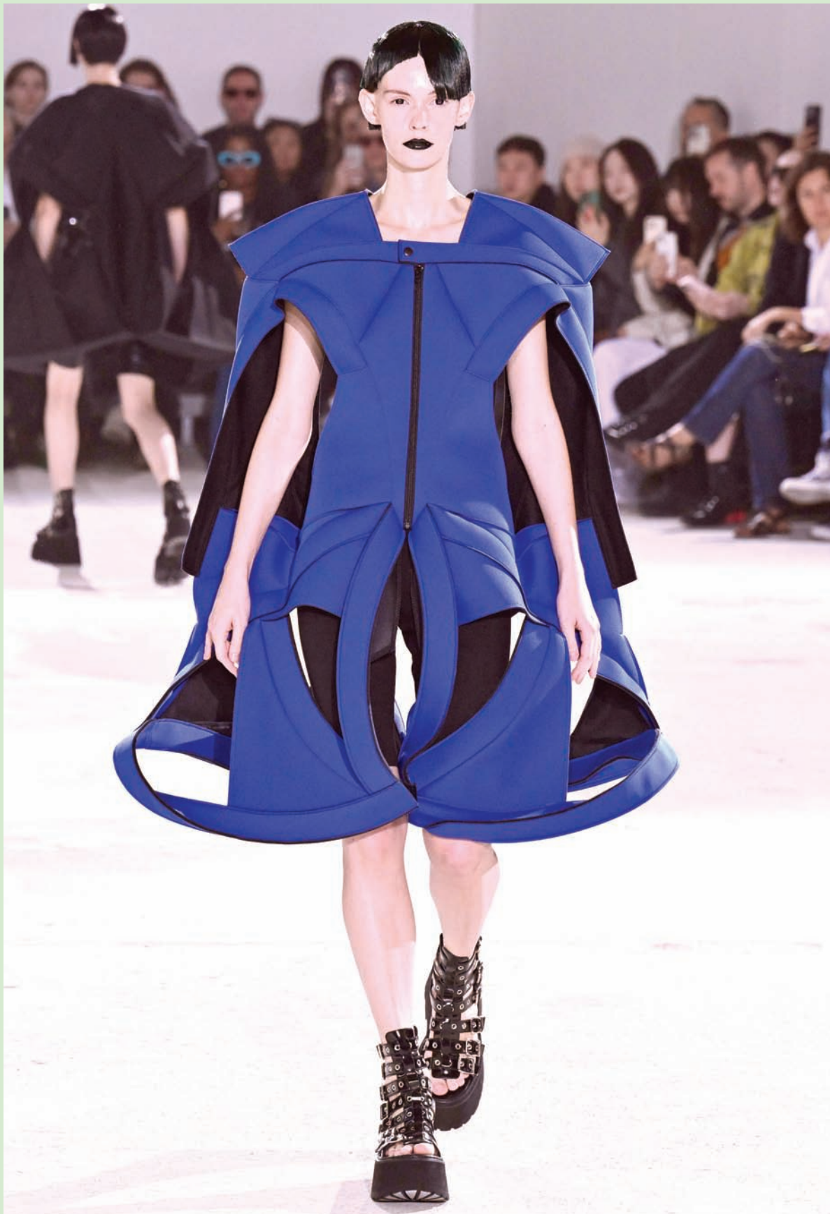
عازضة تقدم تصميماً لدار «جونيا وأتاني» اليابانية خلال أسبوع الموضة في موسم عروض الأزياء النسائية في باريس لربيع وصيف 2024