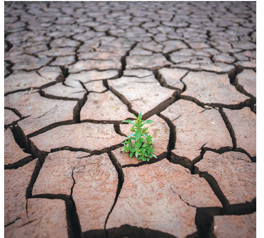
نبته تقاوم للبقاء في أرض ضربها الجفاف شمال برشلونة الإسبانية

تراجع معدل حصة المواطن العربي من المياه العذبة بنحو 50 في المائة