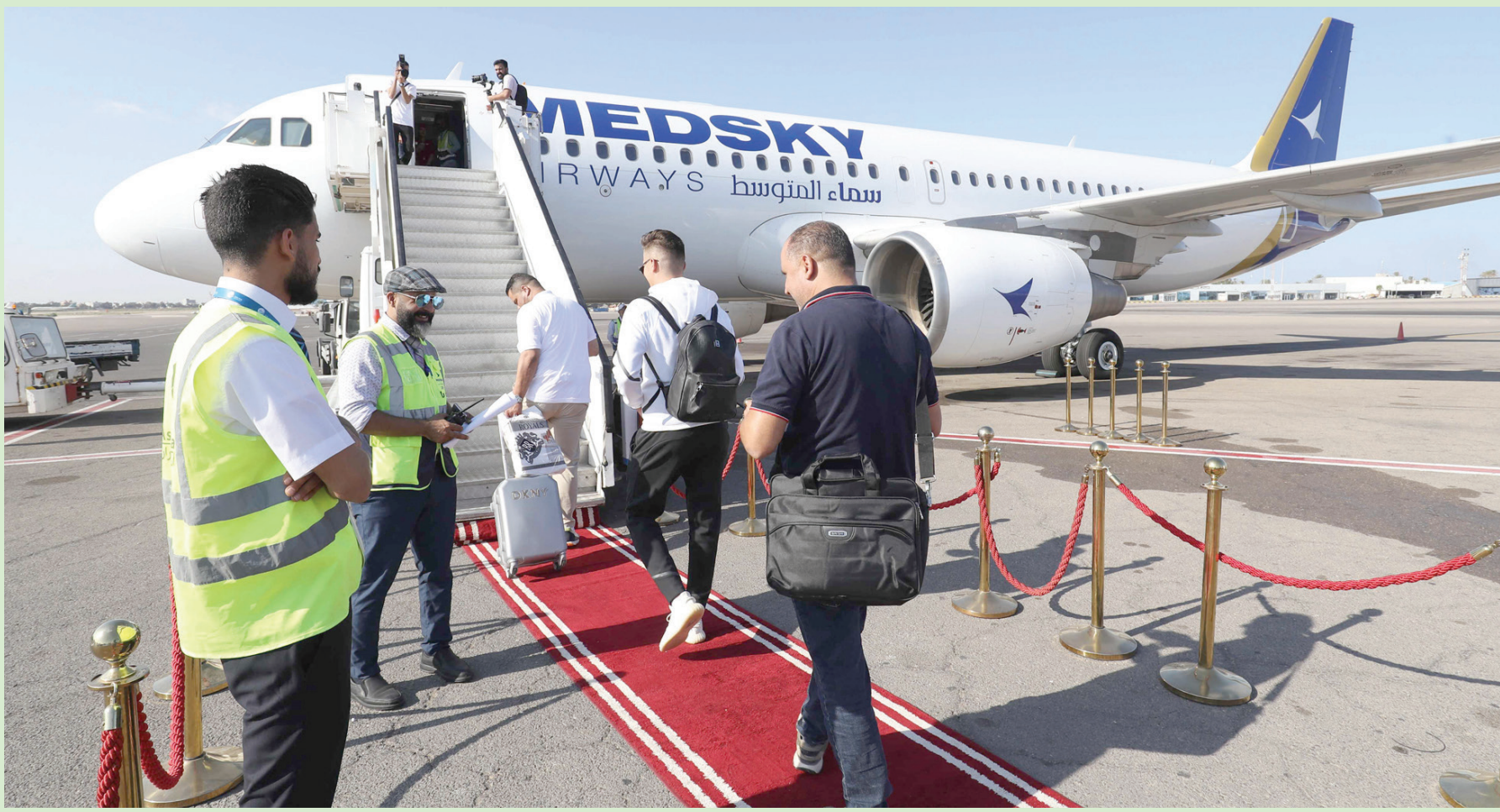
بعد انقطاع دام نحو 10 سنوات، استؤنفت، أمس (السبت)، الرحلات الجوية بين ليبيا وإيطاليا. وأقّلت طائرة تابعة لشركة «ميدسكي» الليبية الخاصة من مطار مبيعتة بترابلس إلى مطار فيوميتشينو بروما، على أن تؤمن الشركة رحلتين أسبوعياً إلى العاصمة الإيطالية يومي السبت والأربعاء

تهدد ندرة المياه النظيفة نحو 6 مليارات شخص في العالم بحلول عام 2050، إذ تتعرض دول منطقة جنوب الصحراء الكبرى والشرق الأوسط بشكل خاص لإجهاد مائي شديد، كما تعاني دول أوروبية مثل إيطاليا وإسبانيا وبلجيكا مخاطر مائية عالية. ومن المتوقع أن يزداد الوضع سوءاً بسبب عوامل العرض والطلب على المياه، مثل