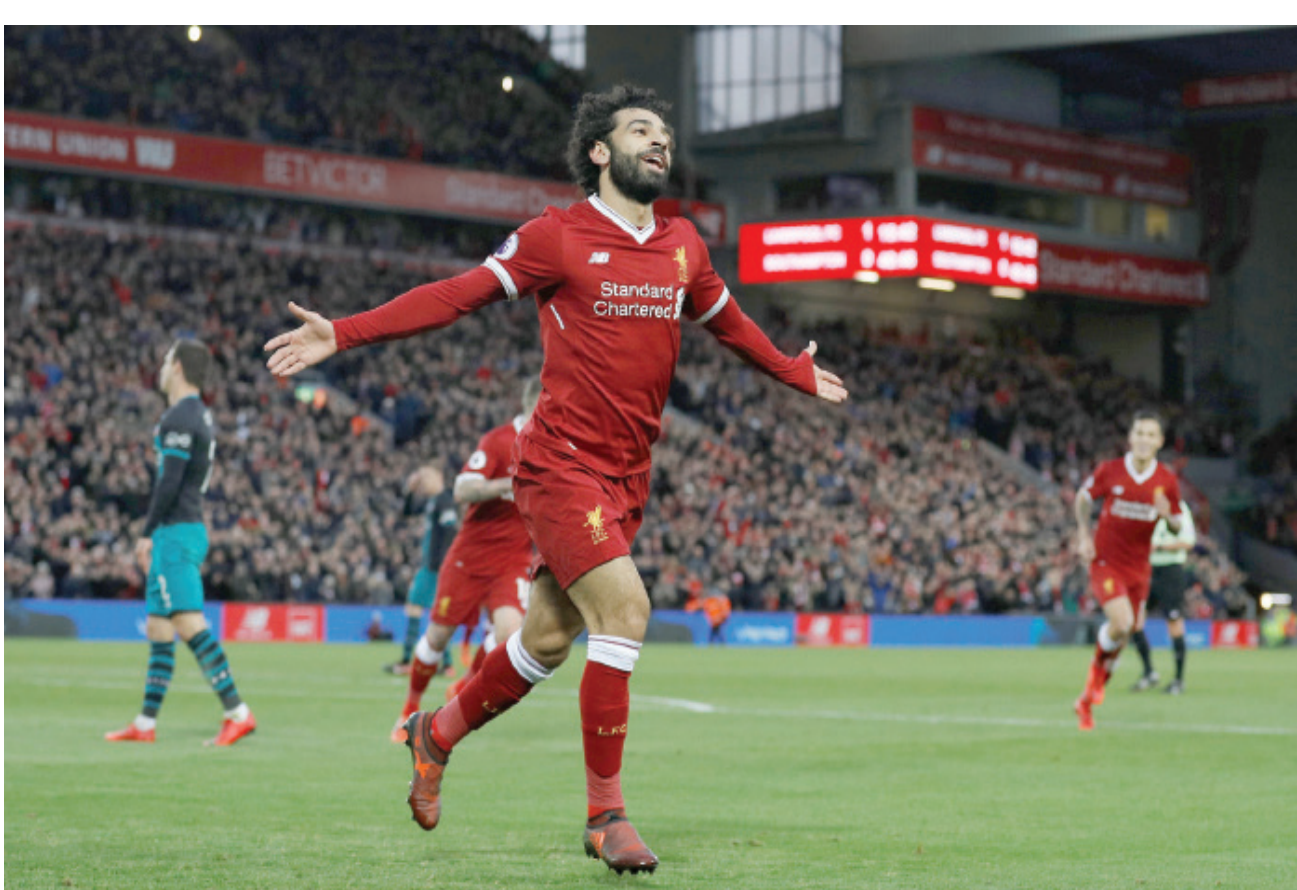
البداية الراقعة لصلاح أثبتت أن كلوب كان محقاً تماماً في عدم بيعه

الرئيسية - 2,5 تمريرة في كل مباراة هذا الموسم - هو أعلى مستوى له في موسم بالدوري الإنجليزي الممتاز، في حين أن معدل تسديده على المرمى، البالغ 3,1 تسديدة في المباراة الواحدة، هو الأدنى له. لا يزال صلاح قادراً على هز الشباك عندما يكون ذلك ممكناً، لكنه أصبح يركز بشكل أكبر على خلق الفرص