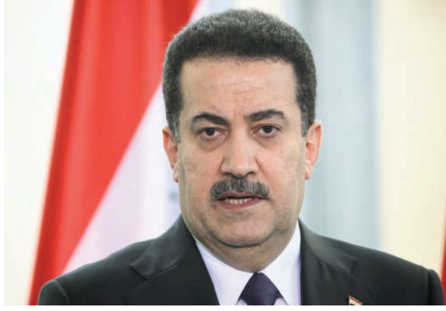
رئيس الوزراء العراقي محمد شياع السوداني في مؤتمر صحفي