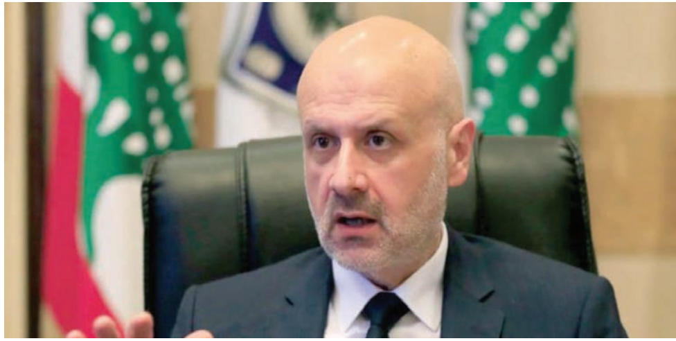
وزير الداخلية في حكومة تصريف الأعمال بسام مولوي (أ.ب)

لبنان وبالقانون». وقال: «يجب تطبيق القانون على كل من يوجد على الأراضي اللبنانية أسوة بالشعب اللبناني»، مطالباً المجتمع الدولي «بخطّة واضحة لعودة النازحين»، داعياً إلى «إزالة المخالفات في كل البلديات والاتحادات وإلى حماية الأملاك العامة والمشاعات الخاصة بالدولة اللبنانية التي هي حق كل مواطن، وكلنا شركاء في مسؤولية الحفاظ على أملاك ومشاعات الدولة لا للتعدي عليها». وصعدت القوى السياسية من حملاتها لإعادة اللاجئين السوريين، منذ العام الماضي، وتقول إن لبنان لم يعد قادراً على تحمل اعباء النزوح السوري.