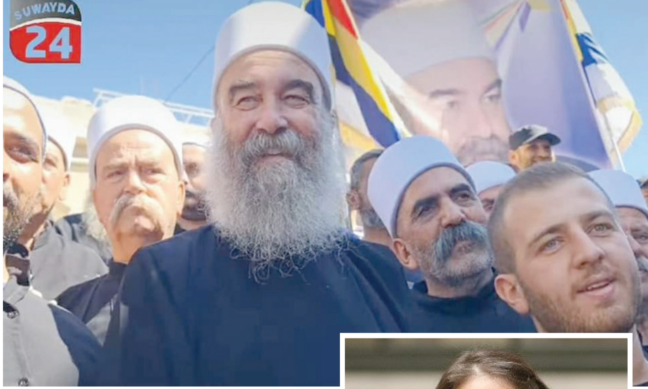
الشيخ حكمت الهجري ضمن المتظاهرين

وتضيف المصادر أن النظام منذ بدء الاحتجاجات، لجأ إلى استخدام أدواته الاستخباراتية القديمة لتفريغ مكانة الهجري الروحية من عناصر قوتها، عبر تشويه صورته والنيل من هيئته والتشكيك بمواقفه الوطنية، بواسطة حملات يشنها نشاطه موالين عبر وسائل التواصل الاجتماعي، إلا أن الموقف الشعبي الداعم