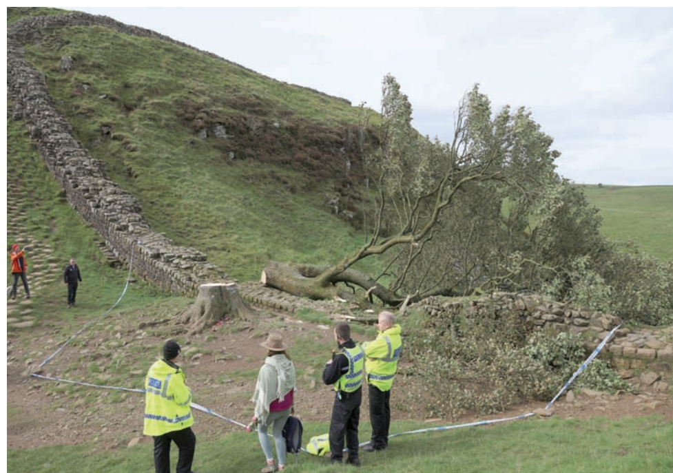
البوليس يجري تحرياته في مكان الشجرة المقطوعة

في بريطانيا اليوم أصبحت قضايا المناخ والحفاظ على الطبيعة أسلحة في يد السياسيين، حيث بدأ حزب المحافظين الحاكم في التخلي عن التزاماته بحماية الطبيعة، يمثل قطع الشجرة رمزاً لمعارك بين دعاة الحفاظ على الطبيعة وبين من يريدون الاستفادة المادية من الأراضي الشاسعة. ولكن قد يكون هناك فصل آخر في قصة شجرة روبن هود، إذ يبحث الخبراء في «ناشونال تراست» الآن الخيارات المختلفة؛ إما لنقل شجرة مماثلة من مكان آخر لتتغل مكان الشجرة المقطوعة أو تركها تنمو مرة أخرى.