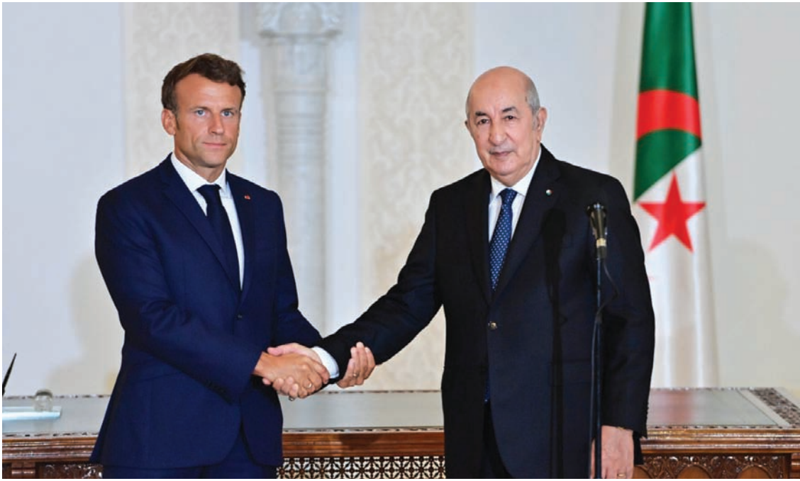
الرئيسان الجزائري والفرنسي نهاية أغسطس 2022

«تشهد حالياً وعياً يتحمل في إعطاء اللغة العربية القيمة العليا الجديرة بها»، موضحاً أن الجزائر «تعاني ضعفاً كبيراً في التخطيط الغوي». ووفق بلعيد، فقد أظهر الرئيس تبون منذ وصوله إلى الحكم «نيات حسنة تجاه العربية تجلت في استعماله الشخصي لها حتى أمام الصحافة الأجنبية. كما أولى الذاكرة الوطنية أهمية كبيرة، بما تحمله من رمزية للدين واللغة».