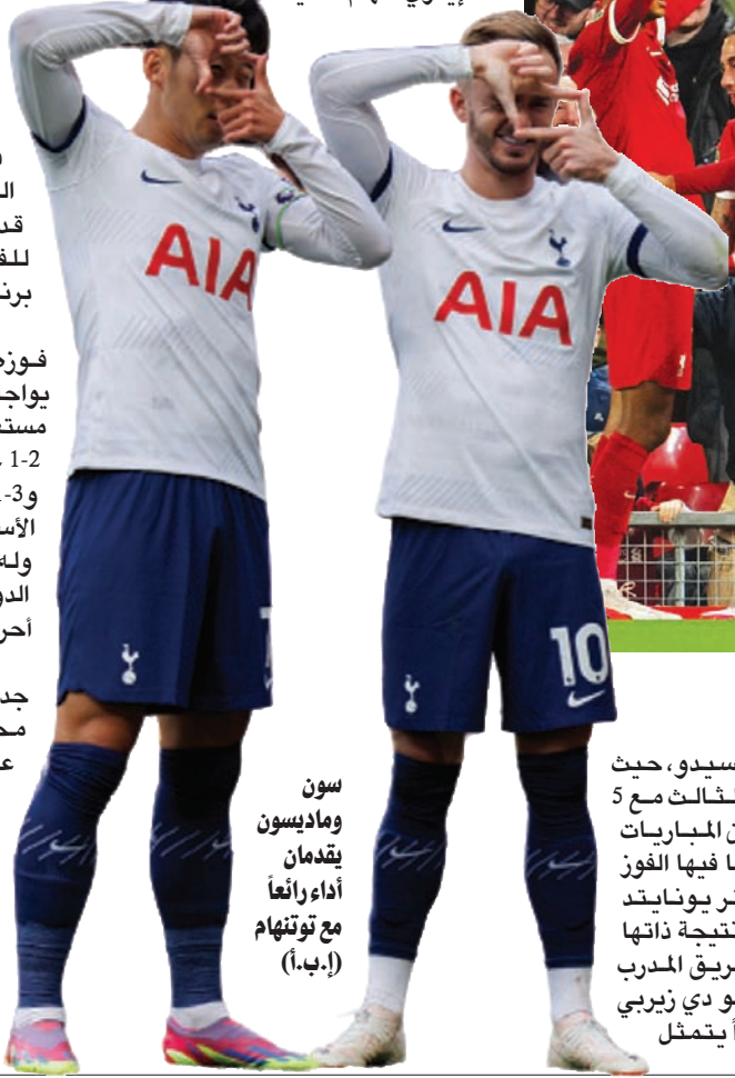
سون وماديسون يقدمان أداء رائعاً مع توتنهام

بالوجود بين المراكز الأربعة الأولى، ولكن بداية عليه الخروج فائزاً من مباراته أمام أستون فيلا (السبت). في المقابل، تبدلت هوية أستون فيلا منذ أن تسلّم المدرب الإسباني أوناي إيمري المهام الفنية