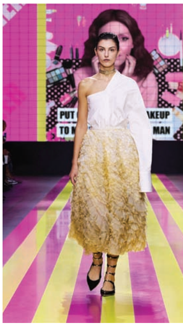
لمسات كلاسيكية ظمعت بعصرية (ديور)

التعايش ما بين الماضي والمستقبل بشكل متناغم». لكن هذا التناغم كان أساسه تناقض كبير بين الشعارات الثائرة على الوضع الحالي بمفهومه الرأسمالي، الذي نددت به إيلينا بلانتوني، وما تقوم عليه الموضة من حاجة لبيع منتجات باهظة الثمن لرأسماليين.