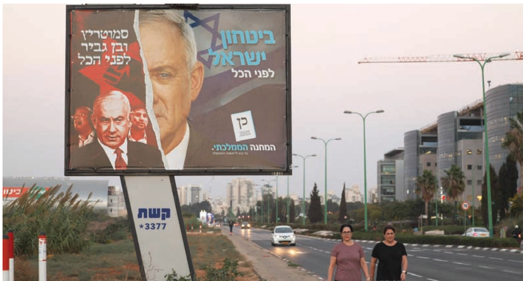
لافتة في الانتخابات الأخيرة بتل أبيب لحزب غانتس تهاجم نتنياهو

وعندما سُئل المستطلعة آراؤهم من الجمهور، «لمن سيصوتون في رئاسة الحكومة من بين الشخصيتين»، أظهرت النتيجة تفوق نتنياهو على غانتس بنسبة 44 إلى 41 في المائة. ورات مصادر مقربة من نتنياهو أن نتنياهو «ثابت وبنحوي عميق؛ إذ إنه ناجم عن إدارته السليمة لشؤون الدولة وقدرته على صد مؤامرة اليسار ضد». وفي المقابل، ترى المعارضة أن «هذه مظاهر مؤقتة، جاءت بسبب خطابه في الجمعية العامة للأمم المتحدة ولقائه الرئيس بايدن والهدية التي قدمتها الإدارة الأمريكية للشعب في إسرائيل، وفهمها نتنياهو على أنها هدية له شخصياً رغم أنه كان قد عرقل مسار منح الإغفاء من التاشير في زمن الحكومة السابقة». وتوقعوا أن تتراجع شعبية نتنياهو من جديد مع