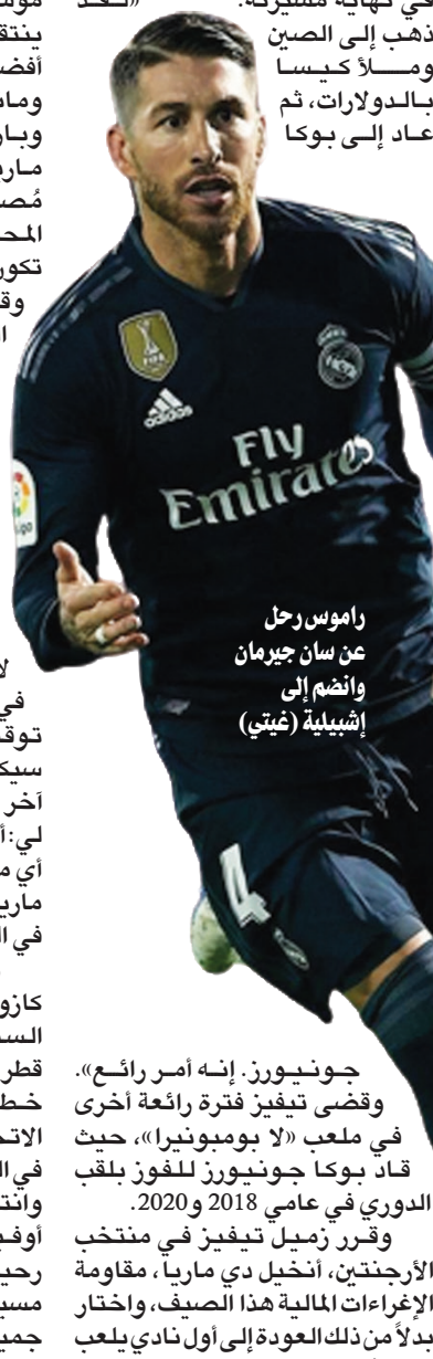
راموس رحل عن سان جيرمان وانضم إلى إشبيلية

انضم راموس إلى إشبيلية في السابعة من عمره وقضى 11 عاماً في النادي قبل أن يشارك مع الفريق الأول للمرة الأولى في عام 2004. وفي الموسم التالي، انتقل إلى ريال مدريد، الذي فاز معه بخمسة ألقاب للدوري وأربعة ألقاب لدوري أبطال أوروبا. وبعد موسمين في باريس سان جيرمان، عاد راموس إلى إشبيلية، بعد 18 عاماً من رحيله. وبعد أن حصل على كل الألقاب والبطولات