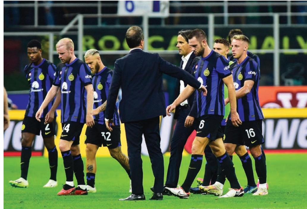
إنتر يسعى لاستعادة نغمة الانتصارات بعد خسارته الأولى هذا الموسم على يد ساسولو

الثالثة. وكان لاتسيو حقق فوزاً ساحقاً على ميلان الموسم الماضي 4-0 في اللعب الأولي، قبل أن يخار ميلان لخسارته إباًاً ويفوز 0-2.