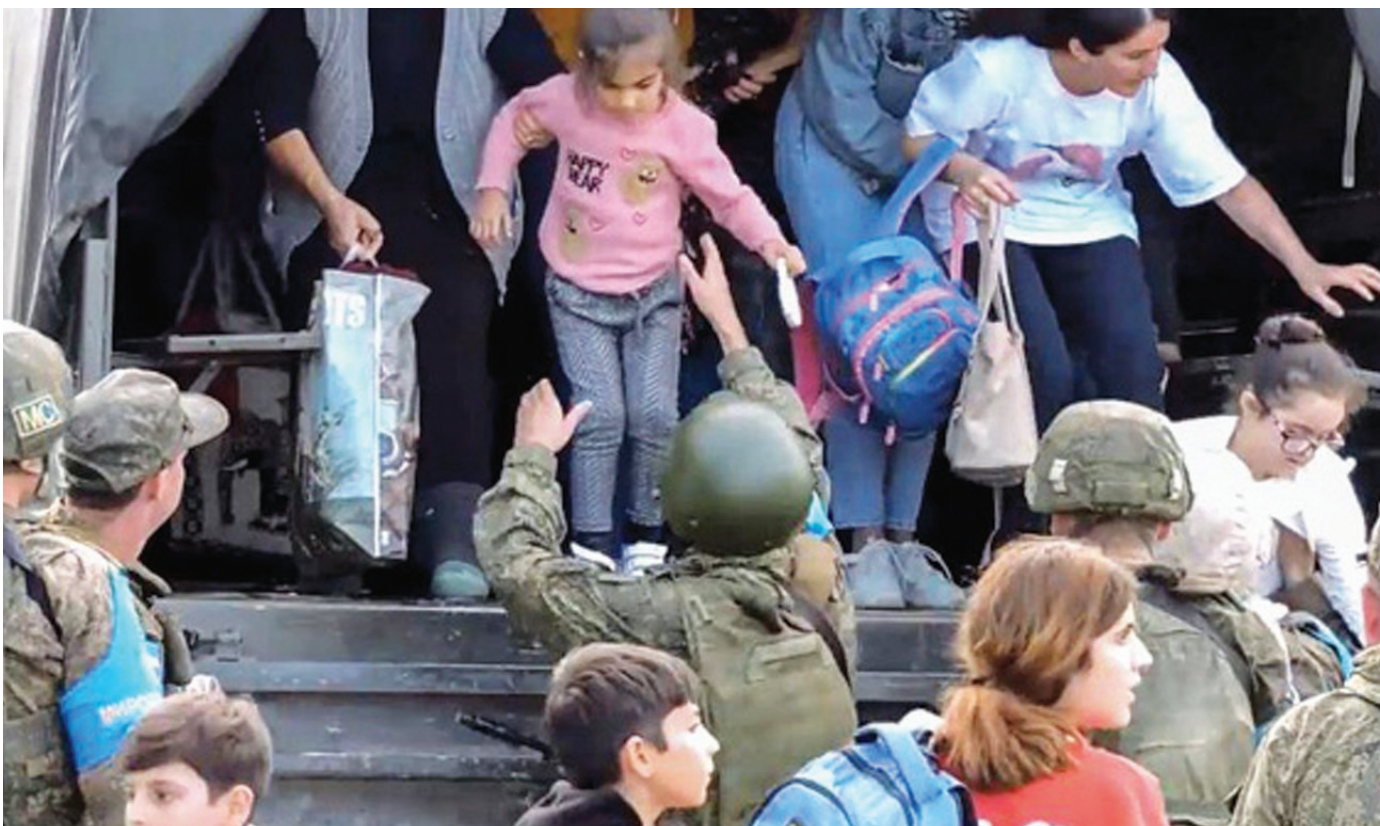
مخنة اللاجئين

كان قد وُضع أساس للتسوية النهائية خلال اجتماعات الرئيس الأذري إلهام علييف، ورئيس الوزراء الأرميني نيكول باشينيان، في براغ وبروكسل، فضلاً عن المفاوضات الثلاثية بمشاورات روسية، بما في ذلك تلك التي عقدت في موسكو في مايو (أيار) 2023، ولقد اعترف في ختام الاجتماعات رئيس الوزراء الأرميني بوحدة أراضي أذربيجان بمساحة 86,6 ألف متر كيلومتر مربع، وهو ما يعني أيضاً إقليم ناغورنو كاراباخ، أي تم حل القضية الإسفرائتجية التي ظلت كعقبة أمام التقدم في تسوية النزاع. وعملياً، عقد باشينيان «صفقة» مع الأذريين، مغامراً بوقوع اضطرابات داخلية واحتجاجات، وربما ثورة مضادة. بالنسبة لباشينيان، كان الدفاع الرئيسي لاتفاقية التسوية حماية السلامة الإقليمية لأرمينيا نفسها. ذلك أن موجة الاشتباكات الكبيرة التي وقعت عام 2022 على حدود الدولتين، كشفت عن ميل ميزان القوى بشكل جلي نحو أذربيجان وإلى تغير المزاج الروسي بشكل واضح أيضاً حيال قواعد الصراع في المنطقة.