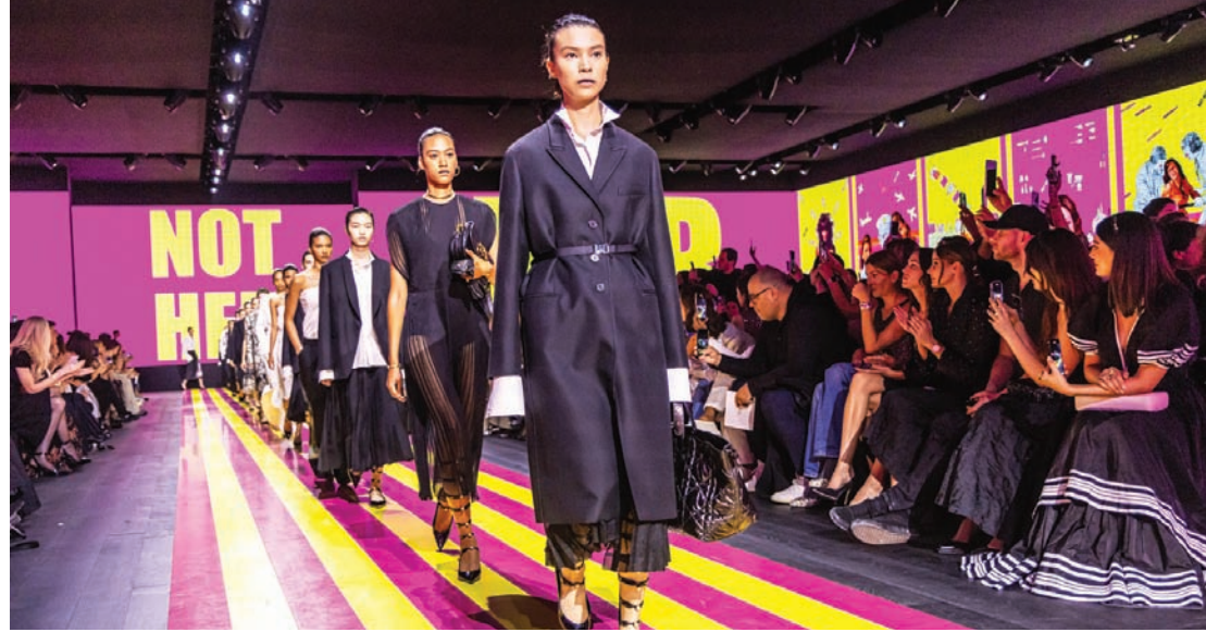
من عرض ديور

سبع سنوات هو عدد الأعوام التي قضتها الإيطالية مارييا غراتسيا كيبوري في دار «ديور» بوصفها مصممة إبداعية، قبلها ظلت القيادة الفنية بيد مصممين كان من بينهم إيف سان لوران ومارك بوهان وجيانفرانكو فيري وجون غاليانو وراف سيمونز الذي تسلمت منه المشعل. دخوله باعتبارها أول امرأة للدار الفرنسية كان نقطة فارقة في تاريخ «ديور» والموضة على حد سواء. أمر فهمت إبعاده كيبوري منذ البداية، وركزت عليها في كل عروضها باحتفالها ببناء مبدعات أو مؤثرات من كل أنحاء العالم. تستحضر أحيانا روحهن وإبحاءاتهن، وأحيانا أخرى تتعاون معهن من خلال تصميم ديورات العرض.