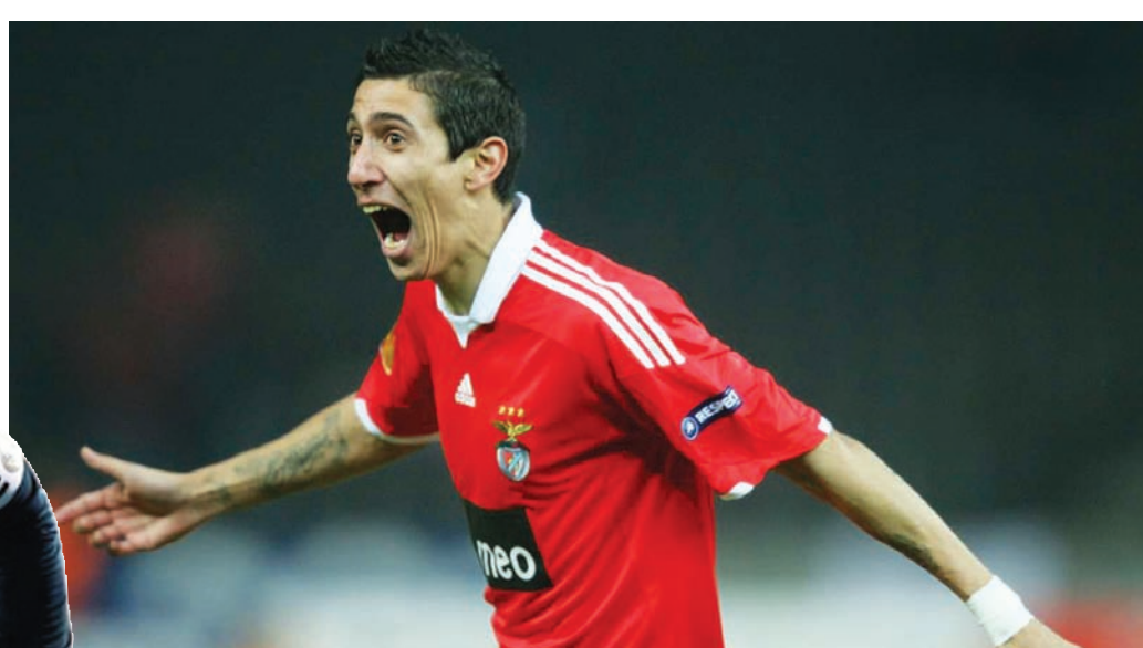
دي ماريا اختار العودة إلى بنفيكا أول نادٍ يلعب له في أوروبا

ويُعد راموس هو الأحدث ضمن سلسلة من اللاعبين الذين عادوا إلى الأندية التي بدأوا معها مسيرتهم لكي ينهوا مشوارهم الرائع هناك. وتضم