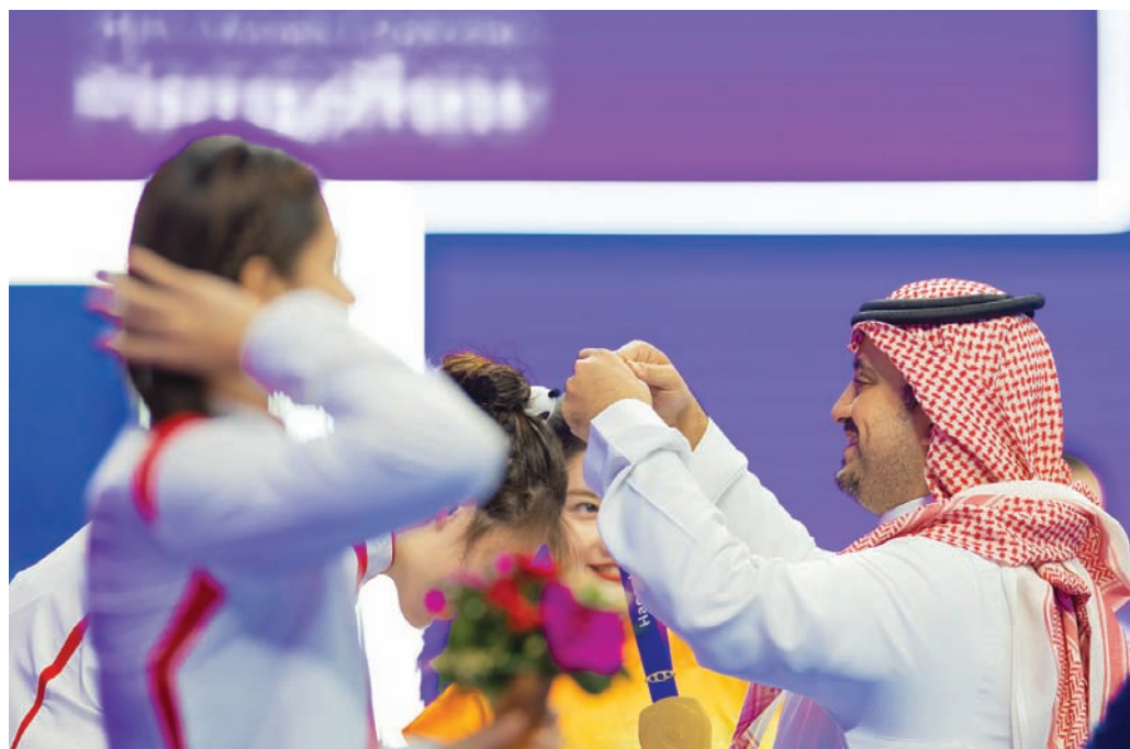
الأمير فهد بن جلوي لدى تتويجه الفائزات في مسابقة السباحة

وفي حال تأهلها من نصف نهائي سباق 100 متر، يختم العداء أبكر ومحمود، منافسات أم الألعاب (الجمعة) بمشاركتهما في نهائي السباق.