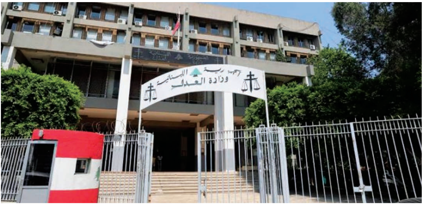
قصر العدل في بيروت

العيش اللبناني للحكم، وهذا أمر غير الديمقراطي ولا يستقيم في بلد كلنا». ثم يضيف: «المطلوب للوصول إلى ذلك تدعيم وضع القضاء اجتماعياً، مقابل تقديمهم تضحيات تمليها عليهم رسالتهم أصلاً... والسؤال: من سواهم (القضاة) تقع عليهم مسؤولية مكافحة الفساد؟ من سواهم بإمكانه إخضاع السياسيين لحكم القانون؟ من سواهم يعطي الإشارات لأجهزة الأمنية... الحل يبدأ بالقضاء وينتهي بمعاينة الفاسدين واسترداد أموال الفساد».