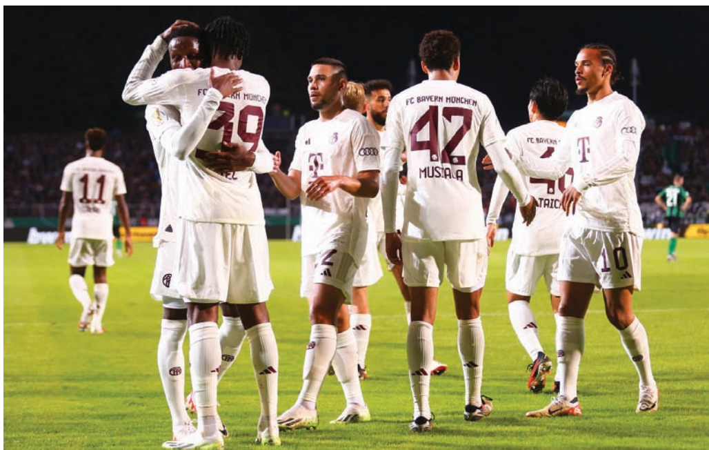
بايرن ميونخ يخوض المواجهة مع لايبزيغ منتشياً بالفوز على بروسيا مونستر في كأس ألمانيا

ويحلّ باير ليفركوزن ضيفاً على ماينز متذلل الترتيب في مواجهة على السورق لرجال المدرب الإسباني تشافي ألونسو. ولم يتعرض ليفركوزن للهزيمة هذا الموسم في الدوري، حيث فاز في 4 مباريات مقابل تعادل، على غرار بايرن، في حين يبحث ماينز عن انتصاره الأول بعد تعادل وهزائم.