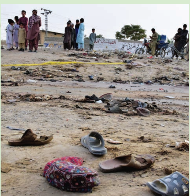
موقع التفجير الانتحاري في مستونغ بإقليم بلوشستان أمس

إسلام آباد - الرياض: «الشرق الأوسط» شهدت باكستان، أمس (الجمعة)، يوماً دامياً؛ إذ قُتل عشرات الأشخاص بتفجيرين استهدفاً موكباً دينياً في إقليم بلوشستان (جنوب غربي البلاد)، ومسجداً قرب بيشاور (في شمالها الغربي). ووصف مسؤولون الهجومين بـ «الإرهابيين»، وقالوا إن أحدهما نفذ «انتحاري». واستهدف التفجير الأول احتفالاً بمناسبة المولد النبوي الشريف قرب مسجد في بلدة مستونغ بإقليم بلوشستان، وأسفر عن مقتل 52 شخصاً