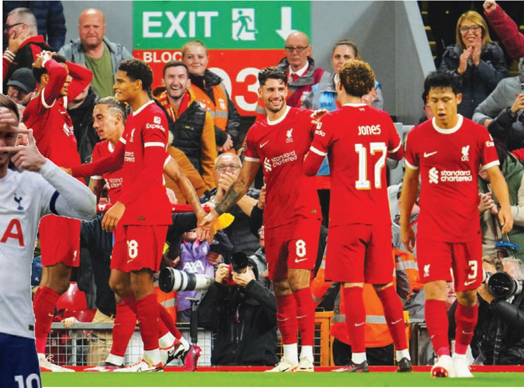
ليفربول يتطلع لمواصلة انتصاراته المتتالية بعد الفوز الأخير على ليستر في كأس الرابطة

مويسيس كايسيدو، حيث يحتل المركز الثالث مع 5 انتصارات من المباريات الست الأولى، بما فيها الفوز على مانشستر يونايتد ونيوكاسل بالنتيجة ذاتها 1-3. ويواجه فريق المدرب الإيطالي روبرتو دي زيري تحدياً جديداً يتمثل