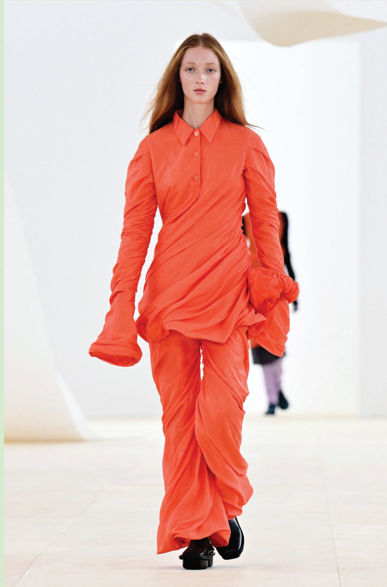
عارضة تقدم زياً من تصميم الدار اليابانية «إيسي مياكي» ضمن فعاليات أسبوع الموضة في باريس

يقولون: كلما حاولوا أن يترجموها إلى لغات ثانية ما يقدرون بسبب قوة الصياغة، وإذا كنتم أنتم شطراً فسروها.