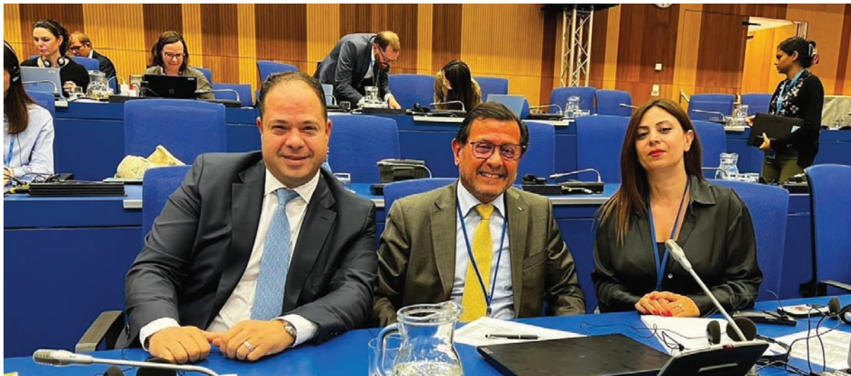
الوفد الفلسطيني في مؤتمر «الوكالة الدولية للطاقة الذرية»

وكان المؤتمر العام لـ«الوكالة الدولية للطاقة الذرية» قد صوت، بإغلبية ساحقة، بلغت 92 دولة مقابل معارضة 5 دول،