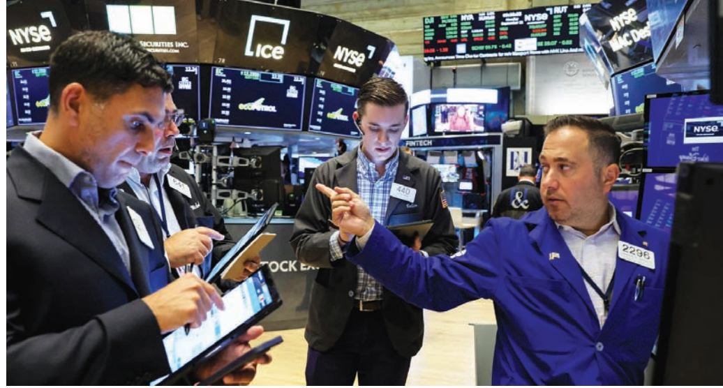
متداولون في وول ستريت بالدور الأرضي لبورصة نيويورك الأمريكية

فعل أكثر مما يحتاج إليه». وأضاف: «قد تعزز هذه القراءة المنخفضة لنفقات الاستهلاك الشخصي فكرة أنهم لا يحتاجون إلى رفع آخر لأسعار الفائدة». وانخفض عائد سندات الخزانة لأجل عامين، الذي يعكس توقعات أسعار الفائدة، 4,6 نقطة أساس إلى 5,025 بالمائة، في حين انخفض العائد على السندات القياسية لأجل 10 سنوات 7,7 نقطة أساس إلى 4,520 بالمائة. وانخفض سعر الفائدة على الإقراض الليلة واحدة من بنك الاحتياطي الفيدرالي بشكل طفيف، مع تراجع التوقعات برفع سعر الفائدة في نوفمبر إلى 13,3 بالمائة من 14,2 بالمائة قبل حوالي 30 دقيقة من صدور البيانات، وفقاً لأداة «فيدوتش» التابعة لمجموعة «سي إم إي».