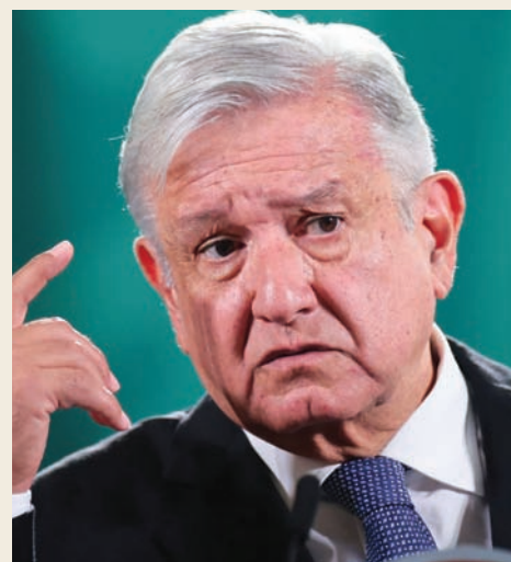
لوبيز أوبرادور

مقابل «ضمانات» بمستوى طموحاته، برخّج آخرون أن يخوض المعركة الرئاسية بصفته مرشحاً ثالثاً في مواجهة شاينباوم، ومرشحة المعارضة اليمينية كسوتشيل غالفين. وكان لوبيز أوبرادور قد علّق على هذا الاحتمال الأخير بقوله «إذا حصل ذلك،