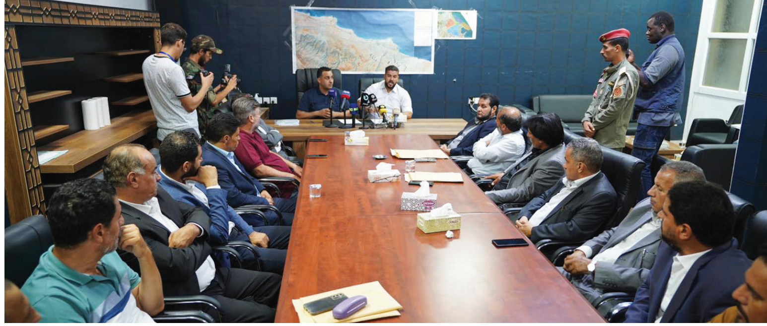
تسليم صكوك التعويضات لعمداء البلديات المتضررة (حكومة الاستقرار)

أعلن الصديق الصور، النائب العام الليبي، حبس 4 مسؤولين محليين في مدينة درنة «احتياطياً» على ذمة التحقيقات التي يجريها في الكارثة، التي حلت بالمدينة جراء العاصفة «دانيال»، بينما أعلن الجيش الوطني الليبي ارتفاع عدد الضحايا إلى 4148 جثة.