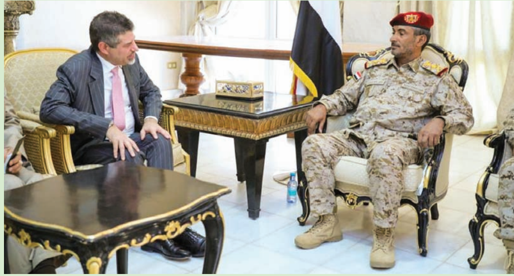
رئيس «هيئة الأركان» اليمني مجتمعاً مع السفير الأميركي

سياسي في اليمن يُنهي المعاناة، كما عبّروا عن دعمهم جهود المبعوث الأممي لليمن للوصول إلى حل للصراع هناك. وكانت قيادة القوات المشتركة لـ«تحالف دعم الشرعية» في اليمن قد أعلنت، الاثنين الماضي، مقتل 3 من القوة البحرينية المرابطة على الحدود الجنوبية للسعودية، في هجوم حوثي بطائرة