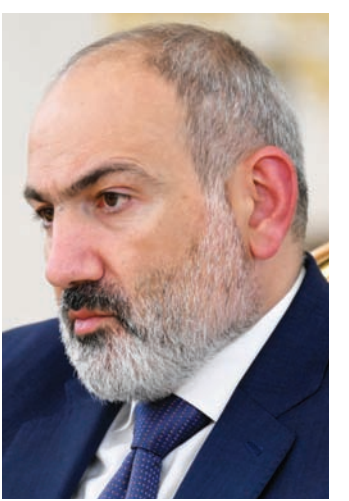
نيكول باشينيان

على الصعيد الإقليمي والعالمي، يمكن القول إن عملية أذربيجان لم تخلق واقعاً جيوسياسياً جيداً بل وضعت اللبنة الأخيرة في واقع تبلور تدريجياً خلال السنوات الأخيرة، وجاءت حرب روسيا في أوكرانيا