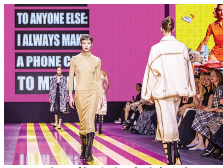
الشعارات النسوية والمناهضة للرأسمالية لم تسرق شيئاً من حرفة الدار

من خلال سينوغرافيات تتوالى فيها شعارات تصب كلها في المعنى نفسه مثل «الرأسمالية لن تأخذها إلى حيث تريد حقاً»، و«ليست هي... لم تعد كما كانت في السابق»، وغيرها من لوحات تُعبر عن رفضها للأفكار النمطية التي تحصل النساء في صور مُحددة، توالى الإطلاقات والإقتراحات التي لم تتجاهل فيها المصممة أن الرأسمالية جزء مهم في عملية بيع الموضة، الرافضة تحديداً. البيان الذي وزعته الدار أشار إلى أن التشكيلة «أبصرت النور نتيجة التآكل في معنى الحاضر. وهو حاضر يبحث على