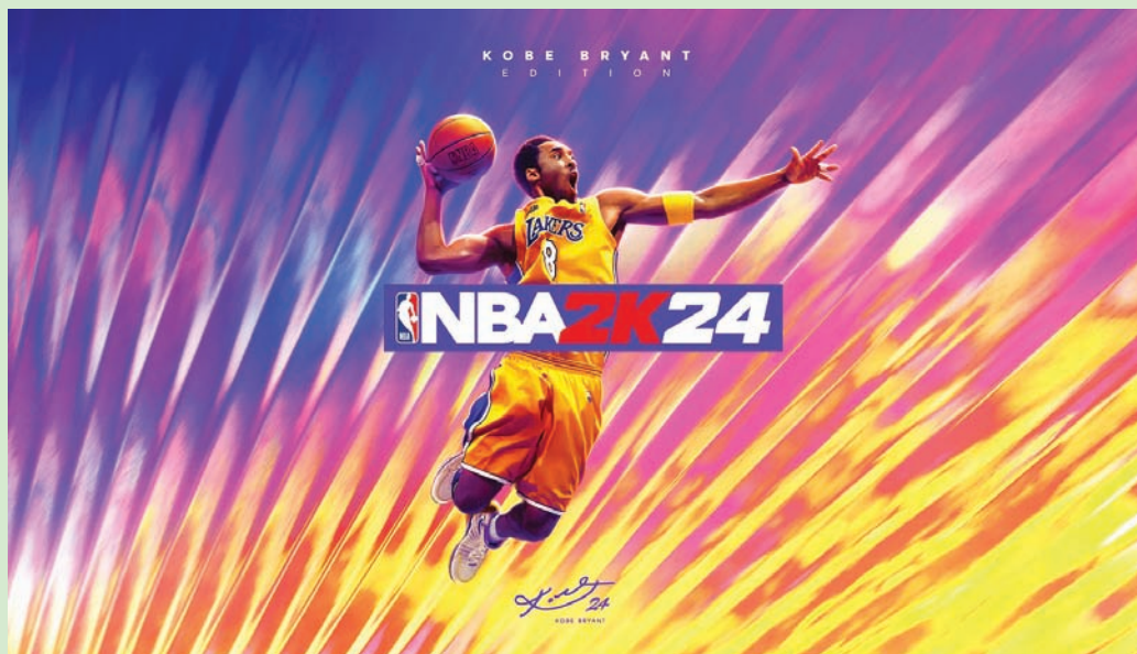
الاستعانة بالنجوم وسيلة تسويقية قوية

«بطاقات» اللعبة التي توفر محتوى إضافياً، وفق الخبر.