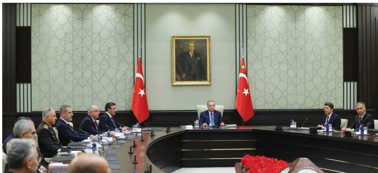
الرئيس التركي رجب طيب أردوغان متحدثاً أمام مجلس الأمن القومي

وطرحت روسيا، التي ترعى مسار تطبيع العلاقات بين أنقرة ودمشق، العودة إلى اتفاقية أضنة، الموقعة عام 199، والتي تسمح للقوات التركية بالتدخل لمسافة 5 كيلومترات في عمق الأراضي السورية حال تعرضها للتهديدات، لكن تركيا تتمسك