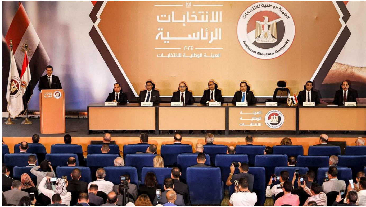
رئيس الهيئة الوطنية للانتخابات بصر خلال مؤتمر صحفي يوم الاثنين الماضي بشأن الانتخابات الرئاسية المصرية

أثار تلمييح أحمد الطنطاوي، أحد المرشحين المحتملين لخوض انتخابات الرئاسة المصرية، بشأن إمكانية عودة تنظيم «الإخوان» إلى المشهد السياسي حال انتخابه، ردود فعل واسعة، وسط مؤشرات على دعم شخصيات محسوبة على التنظيم لذلك المرشح، وانتقادات من جانب شخصيات حزبية ونشطاء له. ما تردد طرح تساؤلات عدة بشأن مدى تأثير التنظيم (الذي تحظره السلطات المصرية) وأتباعه في الانتخابات الرئاسية المقبلة، سواء عبر دعم أحد المرشحين لخوض المنافسة، أو من خلال مشاركتهم بالتصويت في الاقتراع المقرر في ديسمبر (كانون الأول) المقبل.