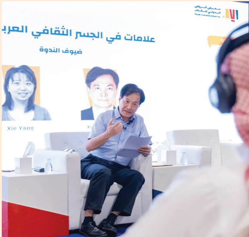
شوي تشينغ قوه خلال ندوته في معرض الرياض الدولي للكتاب (واس)

التي حظيت بعدد من الزيارات. ويقول عن الرياض: «لاحظت أن مدينة الرياض تشهد تطوراً هائلاً، يتماثل في نواح عديدة، وهي تسير في الاتجاه الصحيح... ولعل أبرز ما لاحظته باعتباري مهتماً ومرقياً اجنبياً، أن السعودية عموماً، والرياض خصوصاً، تسير نحو مزيد من الانفتاح والاعتدال والفهم العصري للإسلام، ونحو تمكين المرأة».