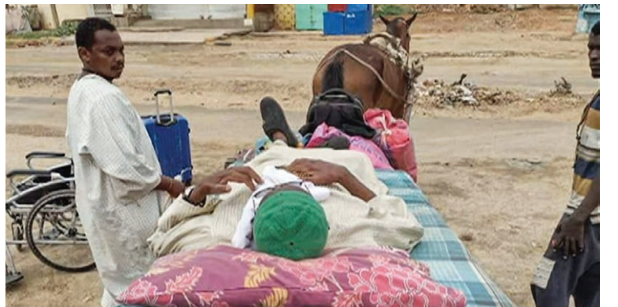
صورة من مقطع فيديو متداول لمسّن سوداني يُنقل على عربة كارو