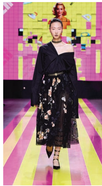
بصمات «ديور» لم تقب تماماً (خاص)