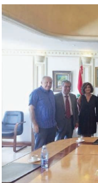
نائب حاكم مصرف لبنان، وسيم منصور رئيس وأعضاء نقابة محري الصحافة (الوكالة الوطنية للإعلام)

وأشاد منصور، في المقابل، على أهم المصارف المركزية في المنطقة، لدينا 8 مليارات ونصف مليار دولار، ولدنيا الذهب بقيمة 18 مليار دولار، ويطلب منا خبراء من المصرف إلى الخارج لتدريب مصرفيين، ولدينا الأملاك وعددها كبير. المبدل ليست قيمتها مليار دولار. علينا توضيح العلاقة التسليمة المالية مع الدولة. وخلال فترة غير بعيدة سيصبح لدينا مؤسسة مهمة. الأخطاء التي ارتكبت هي مسؤولية الجميع، كلنا كان يرى المشكلة، أي كل المسؤولين في الدولة».