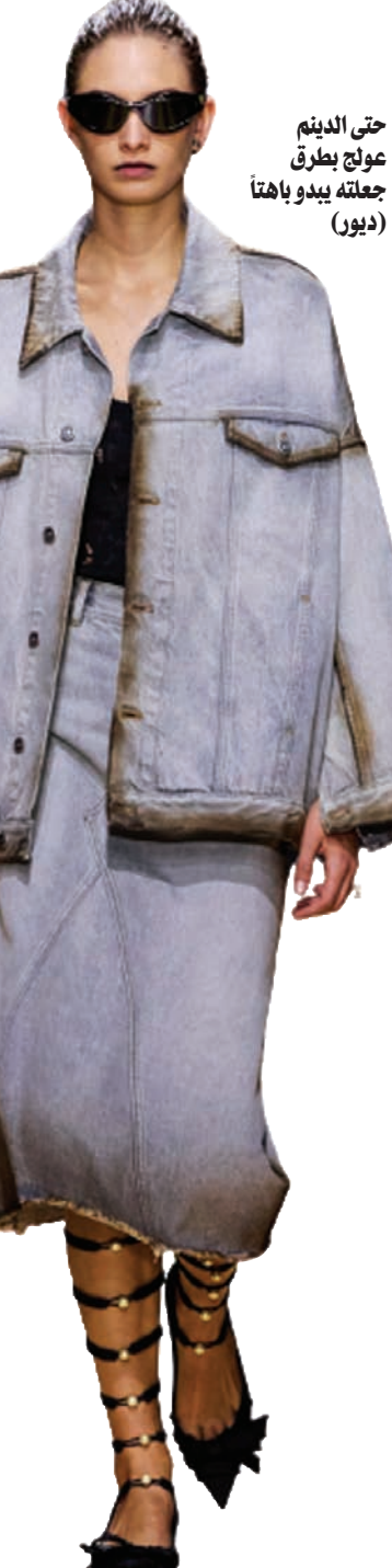
حتى الدبلم عولج بطرق جعلته يبدو باهتاً (ديور)

وهو ما جسسته في تصاميم مريحة وغير مقيدة، تراقصت في الكثير من الإطلاقات على النعومة والضيائية، وبدت فيها مجموعة من الإطلاقات متاكلة من الحواف أو ممزقة بعد أن تمت معالجتها لتبدو بالية، تستحضر لنا روح الفنان الإيطالي البرنو بوري، أحد رواد حركة الفن المتكشف الذي اعتمد على المواد الرخيصة، لكن هذا الجانب لم يؤثر على صورة «ديور» القائمة على الأناقة والفخامة. فالجهد على الرأسمالية تبقى مجرد شعارات، وعلامات الفقر مجرد فكرة للنقاش. أما التصاميم التي ستطرح في ربيع وصيف 2024 فستستعيد كما قالت الدار العلاقة التي تربط بين الجسم والملابس ويتم تحديدها في سياق العصر الحالي، بدلاً من أن تقتصر على وقت محدد أو على الحنين إلى الماضي. أي أنها لا تعترف سوى بالأناقة التي تتحدى كل الأزمنة والسياسات؛ لأن قانون الإغراء فيها أقوى من أي شيء.