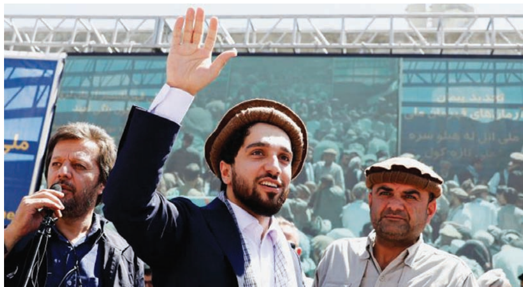
أحمد مسعود الزعيم الأفغاني المناهض لـ «طالبان» بين أنصاره (أرشيفية)

وقال مسعود سابقاً في مقال رأي كتبه في صحيفة «واشنطن بوست»، بعد سقوط كابل في يد «طالبان»، إن الألاف من قوات الكوماندوس وضباط الجيش الأفغاني لجأوا إلى إقليم بانشير (بنجشير باللغة المحلية والفارسية) الصعب التضاريس، بمثابة قبلة موقوتة».