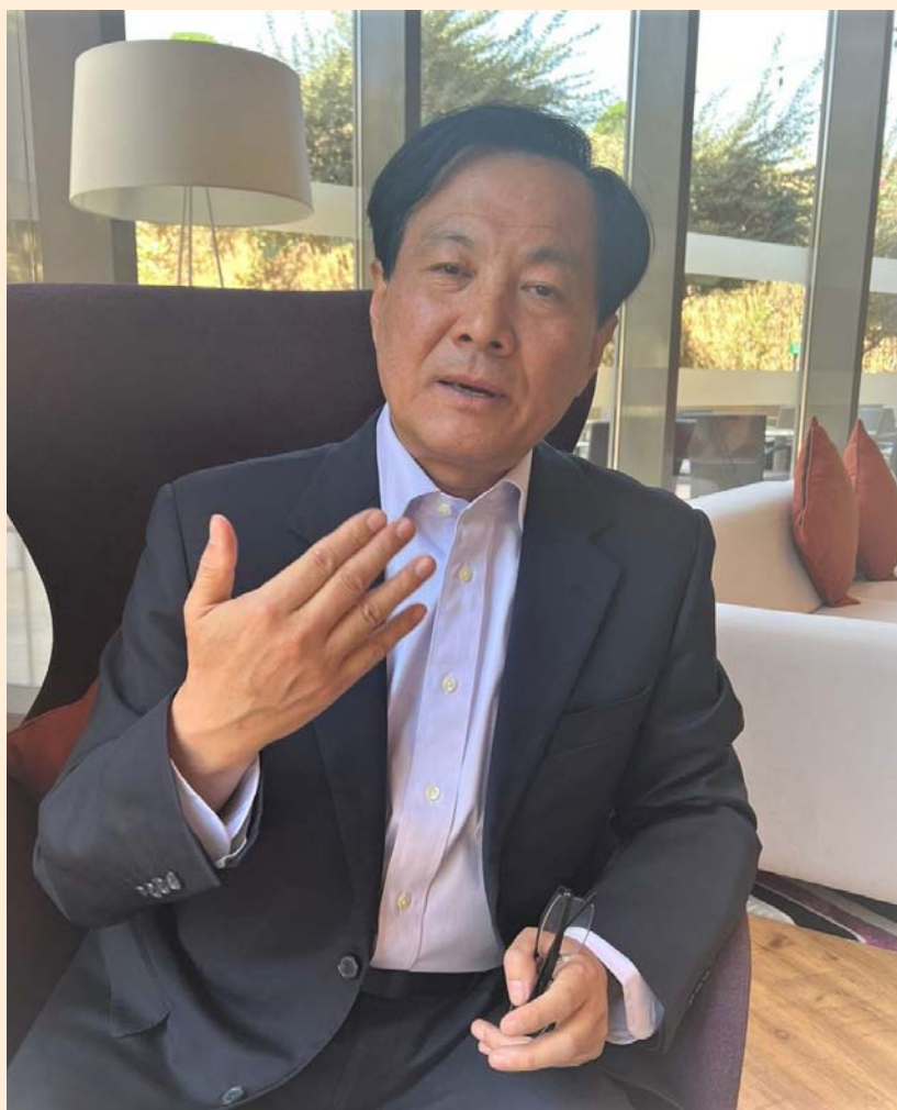
المترجم والباحث الصيني د. شوي تشينغ قوه متحدثاً لندوة الشرق الأوسط

واشتغل الدكتور شوي تشينغ قوه بالترجمة، وترجم إلى اللغة الصينية أعمال جبران خليل جبران، وأدونيس الذي ما زال يحتفظ بعلاقات وثيقة معه، كما ترجم أعمال محمود درويش، ونجيب محفوظ، وسعد الله ونوس، كما ساهم في ترجمة أعمال صينية بارزة إلى اللغة العربية مثل؛ ترجمة كتاب «الحوار» لكونفوشيوس، وكتاب «التأويل تشينغ» للمعلم لاو تسي، وكتاب «منشيوس» لمنغ تسي، بالتعاون مع المترجم السوري فراس السواح.