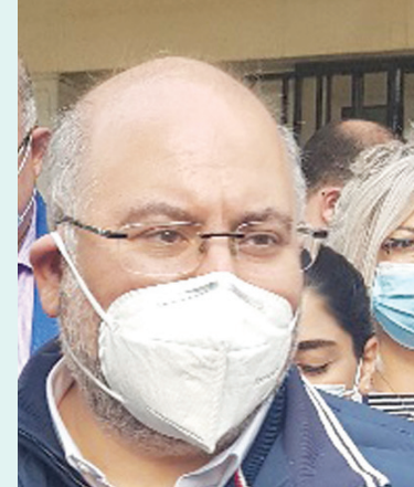
بيروت: «الشرق الأوسط»

أعلن وزير الصحة اللبناني فراس الأبيض، عن تأمين مستشفيات المستشفيات المتعلقة بتكاليف مرضى غسل الكلى، وذلك بعدما أعلنت نقابة المستشفيات عن توقيف استقبال المرضى مطالباً بالحصول على مستشفياتها المتأخرة من الجهات الضامنة.