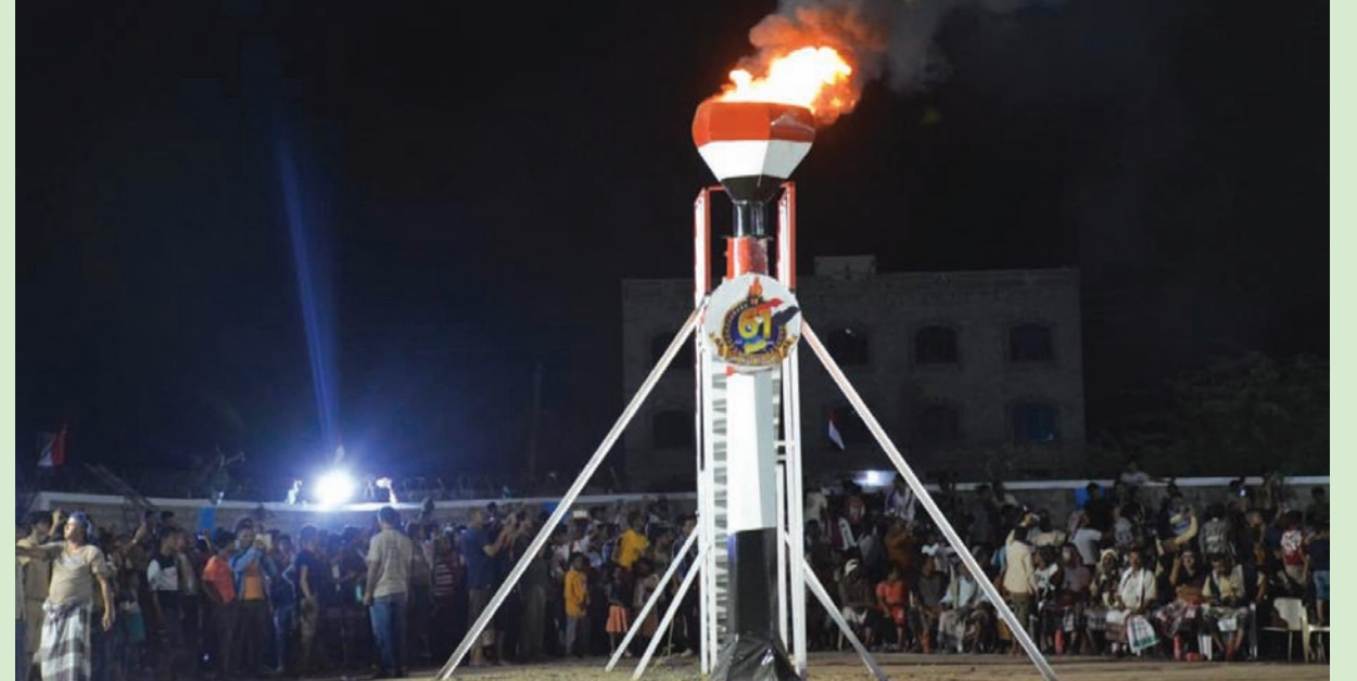
يخشى الحوثيون أن تتحول احتفالات اليمينيين إلى انتفاضة عارمة (اكس)