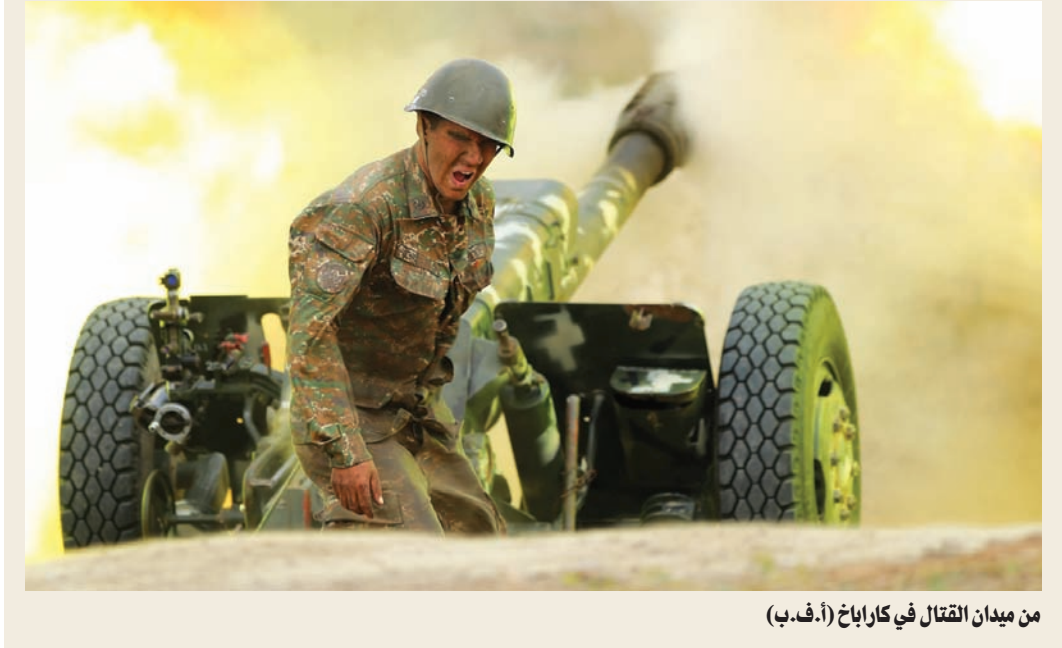
من ميدان القتال في كاراباخ

جماعت تلك التطورات على خلفية اندعاد الود أصلاً بين الكرملين والقيادة