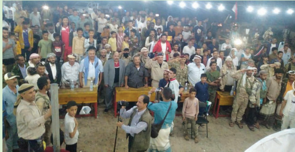
أحيا اليمينيون ذكرى «ثورة 26 سبتمبر» في المناطق كافة (اكس)