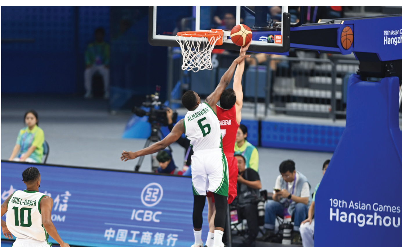
السلة السعودية تبحث عن بطاقة التأهل عبر الأبراج الإماراتية

رئيس الوفد السعودي المشارك في دورة الألعاب الآسيوية «هانغتشو 2022»، الفائزات في منافسات سباق 50 متراً بسباحة الفراشة، التي جرت ضمن مسابقات السباحة.