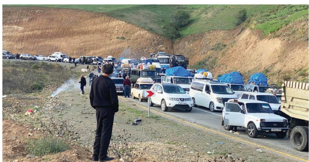
قافلة طويلة من السيارات التي تقف قاذبين من كاراباخ تنتظر عبور الحدود إلى أرمينيا يوم الخميس (أ.ب.)

وفي المجموع، أفيد عن مقتل نحو 600 شخص في أعقاب الهجوم العسكري الخاطف الذي شنته باكو وادى إلى استسلام الانفصاليين في 20