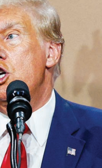
يتقدم ترمب على منافسيه الجمهوريين بفارق كبير

ويوافق مدير تحرير الموقع الإلكتروني «رو ستوري» ديف