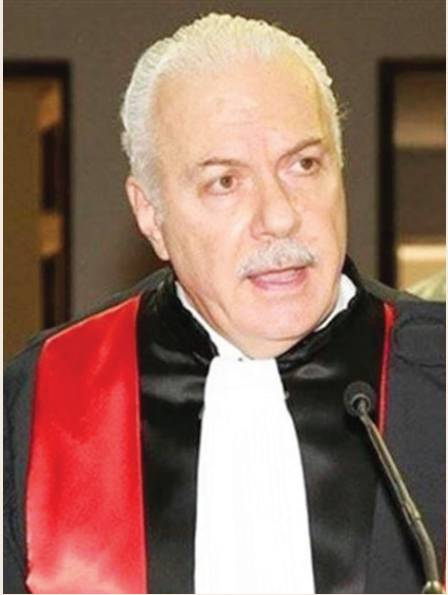
القاضي سهيل عيود

يومذاك تسبب الاعتكاف بمواجهة غير مسبوقة بين جريصاتي ومجلس القضاء الأعلى؛ إذ اعتبر الوزير أن الاعتكاف يشكل تحدياً له ولعهد عون في ديانته. ووجّه حينها كتاباً إلى مجلس القضاء الأعلى دعاه فيه إلى «تنبيه القضاة من استمرار في الاعتكاف، وتحملهم مسؤولية أجواء غير صحية تسود أروقة قصور العدل». واستدعى كتاب وزير العدل رداً سريعاً من مجلس