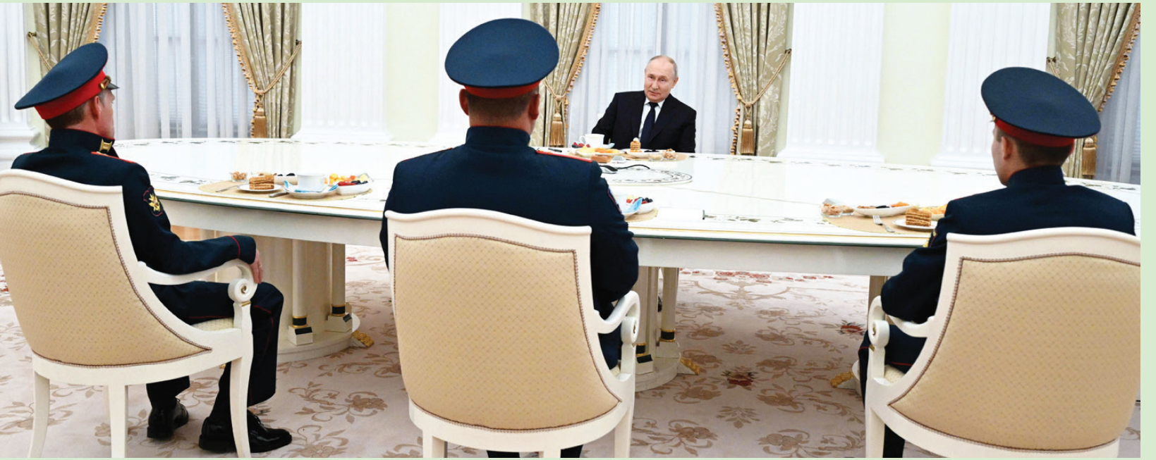
صورة وزعتها وكالة «سبوتنيك» الروسية للرئيس بوتين خلال اجتماعه بالكرملين أمس مع قادة عسكريين مشاركين في الحرب الأوكرانية (أ.ف.ب)