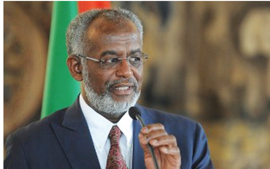
علي كرتي الأمين العام للحركة الإسلامية، في السودان

وأوضح إبراهيم أن العقوبات أكدت دور الحركة الإسلامية بقيادة كرتي في إشعال الحرب ابتداءً، وعملها على استمرارها من أجل المحافظة على مصالحها والعودة للحكم مجدداً، أو في الحد الأدنى لبقائها مؤثرة على الساحة السياسية، وبقاء «الدولة العميقة» التي كانت لجنة تفكير نظام 30 يونيو (حزيران) على تفكيكها. ودعا إبراهيم إلى عدم الاكتفاء بالعقوبات التي صدرت