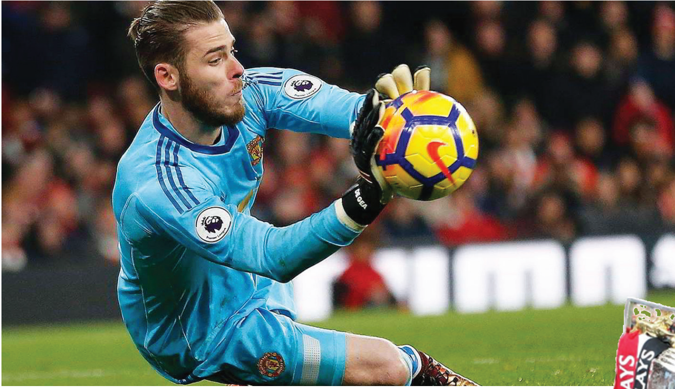
ديفيد دي خيا قد يعتزل إذا لم يتلق عرضاً من ناد كبير