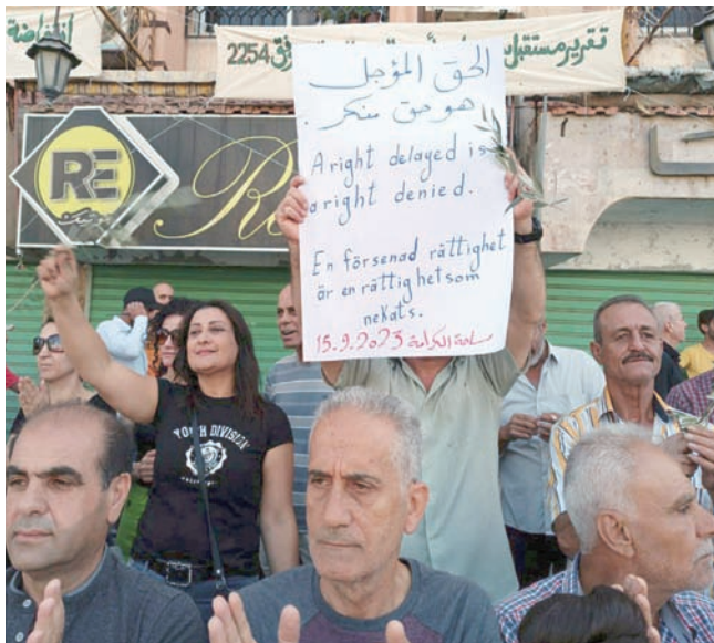
جانب من الشعارات التي رفعها المشاركون في احتجاجات السويداء أمس

عناصر حراسة المقر، الأمر الذي دفع بعناصر الحراسة إلى طردهم».