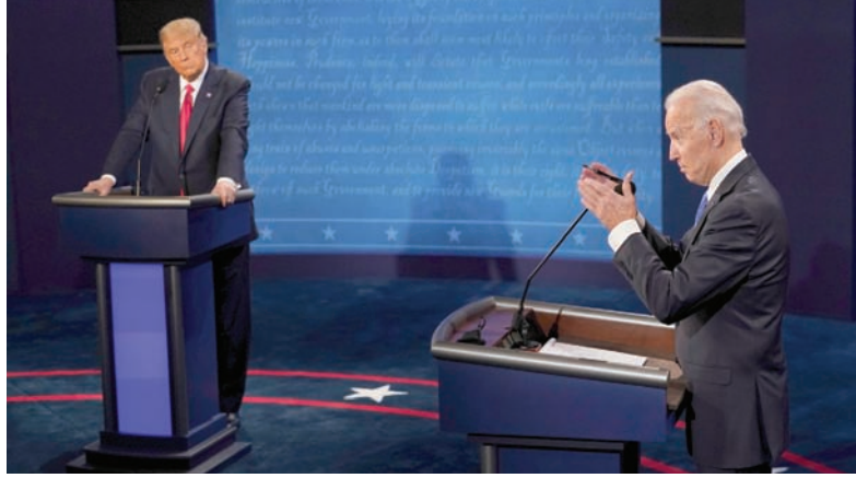
بايدن وترمب خلال المناظرة الرئاسية في 22 أكتوبر 2020 بولاية تينيسي