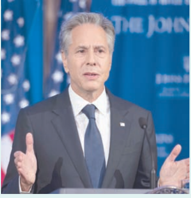
وزير الخارجية الأمريكي أنتوني بلينكن

المختلفة تشكل تحدياً، مضيفاً: «اعتقد أن ذلك ممكن جداً، إلا أنه ليس مؤكداً على الإطلاق». ولمح إلى «ترتيب يتضمّن على الأقل 3 دول قادرة على الوصول» إلى ذلك، بضمانة الولايات المتحدة، متوقّعاً «إحراز تقدم في عدد من القضايا بعدد من المجالات التي من الواضح أنها في مصلحتنا».