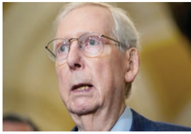
ماكونيل يتحدث للصحافيين بمبنى الكابيتول في 12 سبتمبر 2023