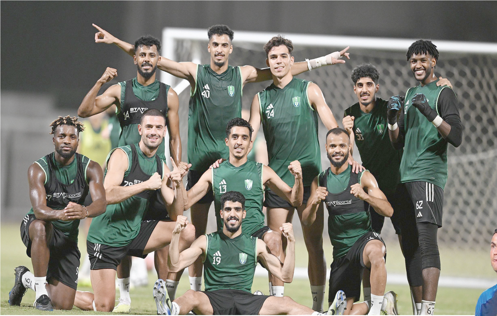
الأهلي يأمل مصالحة جماهيره بعد خسارة الفتح (الشرق الأوسط)

ويملك الأصفر تسع نقاط ويتطلع للعودة إلى العاصمة الرياض بالنقاط الثلاث قبل أيام قليلة من مواجهته القوية أمام الأهلي في قمة منافسات الجولة السابعة التي ستقام على ملعب «الأول بارك» في الرياض.