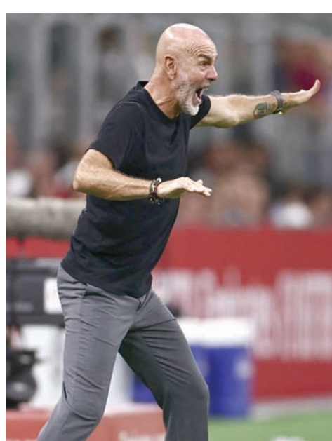
بيولي مدرب ميلان

وهذه فضيحة جديدة لـ«بيانكونيري» بعد خصم 10 نقاط من رصيده الموسم الماضي، بسبب أنشطة مالية مشبوهة في صفقات