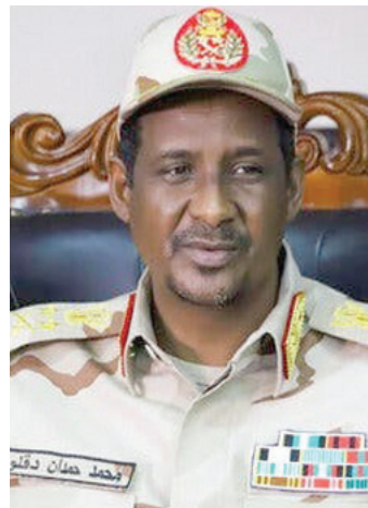
قائد «الدعم السريع» محمد دقلو

وتزداد معاناة السودانيون باستمرار الحرب، خاصة أولئك الذين لم يغادروا الخرطوم، ويحاولون باستمرار التعايش مع واقع الحرب وإيجاد بدائل للتغلب على الأوضاع السيئة التي يعيشونها. فقد لجأ البعض إلى الاعتماد على الأرز بدلاً عن الخبز؛ لأن الحصول على الخبز صعب للغاية، وطوابير الناس على المخازن القليلة التي لا تزال تعمل، تمتد لمسافات طويلة، وفي النهاية لن يحصل المرء إلا على حصة خبز لا تكفي ليوم واحد.