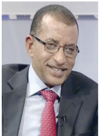
القيادي في «الحرية والتغيير» عمر الدقير