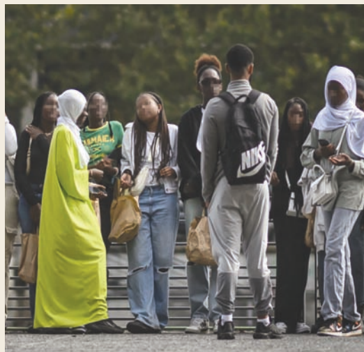
قرار منع العبایة في المدارس أثار جدلاً واسعاً في فرنسا

بالتشدد ضد الإسلام في بيئة سياسية شعبية على حساب الأقلية المسلمة، وهو أمر أكدته كثير من الدراسات، آخرها من إنجاز معهد «إيسوس» الذي كشف فيها أن 80 في المائة من الفرنسيين يؤيدون قرار وزير التربية بحظر العبایة في المدارس، بمن فيهم الفرنسيون ذوو الخلفيات البسارية، حيث إن 65 في المائة منهم يؤيدون القرار أيضاً. في أي حال، ورغم تهيشها، فالجالية المسلمة في فرنسا هي الأهم في أوروبا. إذ يُقدر تعداد المسلمين في هذا البلد بنحو 5 ملايين، معظمهم جاليات من المغرب العربي وأفريقيا الفرنكوفونية، إضافة إلى تركيا وجنوب شرقي آسيا، لا سيما الهند وباكستان، وهو ما يمثل نسبة 10 في المائة من سكان هذا البلد. وتعيش نسبة كبيرة من هؤلاء في منطقة «اللايل دو فرانس» (أي العاصمة باريس وضواحيها)، وكذلك ضواحي مريليون وليون ومدن أخرى في جنوب فرنسا. أخيراً، يشكو العديد من المسلمين الفرنسيين، منذ فترة طويلة، حسب تقرير لموقع ذي «انترست» من التمييز والتهيش الذي ساهم في فقرهم وعزلتهم داخل مجتمعاتهم. ويوضح تقرير آخر لموقع «ذا سوشاليست» أن المسلمين الفرنسيين يواجهون تمييزاً واسع النطاق، مع معدلات بطالة وقر على بثلاث مرات من المتوسط الوطني، ودخل سنوي أقل بنسبة 30 في المائة.