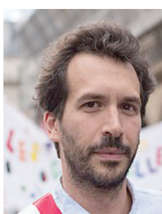
باستيان لاشو نائب عن «حزب فرنسا اليمينية» الفرنسي