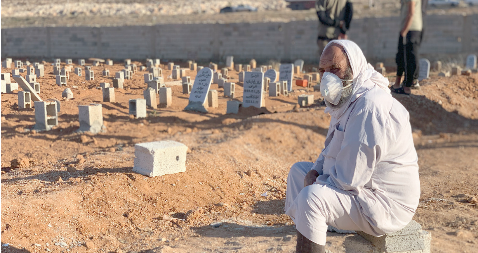
ليبى من مدينة درنة يترجم على عدد من أقاربه الذين قضاوا إحصار دانيال الذي ضرب المدينة