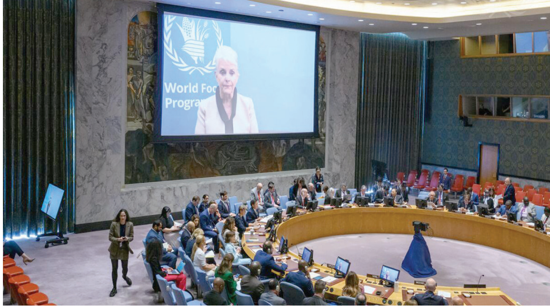
سيندي ماكين تتحدث عبر الفيديو مع أعضاء مجلس الأمن في نيويورك (الأمم المتحدة)

الصحة، والوصول إلى المياه النظيفة والطاقة والجوانب الأخرى للتنمية المستدامة. ووفقاً لتقرير مشترك، أصدرته 18 منظمة متخصصة بتنسيق المنظمة العالمية للأرصاد الجوية، فإن 15 في المائة فقط من أهداف التنمية المستدامة المتعلقة بالطاقة والمناخ والمياه يمكنها أن تعزز أهدافاً مثل الأمن الغذائي والصحة واستدامة المحيطات والمدن القادرة على الصمود. وأشار إلى أن عام 2023 أظهر بكل وضوح تغير المناخ، حيث أدت درجات الحرارة القياسية إلى احترار الأرض وارتفاع حرارة البحار، علماً أن الطقس المتطرف تسبب في حدوث فوضى في كل أنحاء العالم. وقال الأمين العام للمنظمة، بيتري تالاس، إن مجتمع العلوم يقف متحداً في هذه اللحظة المحورية من التاريخ للمشاركة في الجهود المبذولة لتحقيق الرخاء للناس وللوكب، وإن التقدم العلمي والتكنولوجي الرائد مثل المنجحة المناخية عالية الدقة، والكفاء الاصطناعية، والتنبؤ الآني، يمكن أن يحفز التحول لتحقيق أهداف التنمية المستدامة، مشيراً إلى أن توفير الإمدادات المبكرة للجهود بحلول عام 2027 سيؤدي إلى إنقاذ الأرواح وسبل العيش، وسيساعد في حماية التنمية المستدامة.