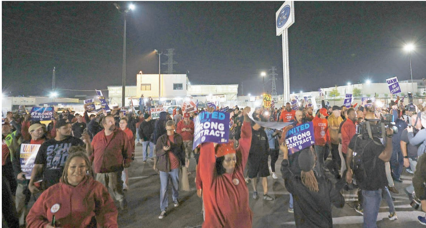
مئات من أعضاء نقابة العاملين بقطاع السيارات يتجمعون أمام مصنع «فورد» في ولاية ميشيغان الأمريكية مع انطلاق الإضراب الأبرز من نوعه في تاريخ الصناعة.

وبدأت المفاوضات بين العمال وأرباب العمل منذ شهرين للتوصل لاتفاقيات عمل جماعية جديدة مدتها 4 سنوات. وتبنت النقابة بقيادة رئيسها المنتخب مؤخراً شون فين موقفاً متشدداً في مفاوضات مع شركات تصنيع السيارات، مطالباً بزيادات كبيرة للأجور وإعادة العمل بعلاوات غلاء المعيشة ورفع الحدود التامينية. وخلال الأشهر الماضية، طالبت النقابة برفع الأجور بنسبة 36 في المائة، بينما عرضت «جنرال موتورز» و«فورد» زيادات