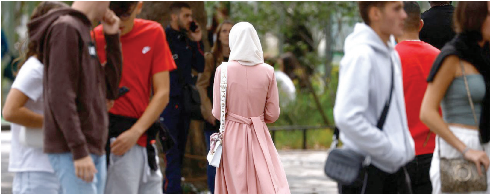
طالبات مسلمات يخرن من مدرستهن بسبب العباية

أما في السويد، فكل الرموز الدينية مُباحة في الحين العام والخاص وفقاً لقانون يضمنه دستور البلاد، وكانت المحكمة العليا للسويد قد أذنت بلبدية سكناني، بجنوب السويد، بعدما منعت البلدية نساء مسلمات من العمل بسبب ارتداء الحجاب، وغير بعيد عن السويد، تمنع الدمارك تغطية الوجه بارتداء البرقع منذ 1905، وهذا بعد على كل من يخالف هذا القانون. وفي النرويج وفنلندا البرقع محظور، علماً بأن الرابطة الوطنية لكرة القدم تمنح للفتيات المسلمات حجاباً رياضياً لتشجيعهن على ممارسة الرياضة.