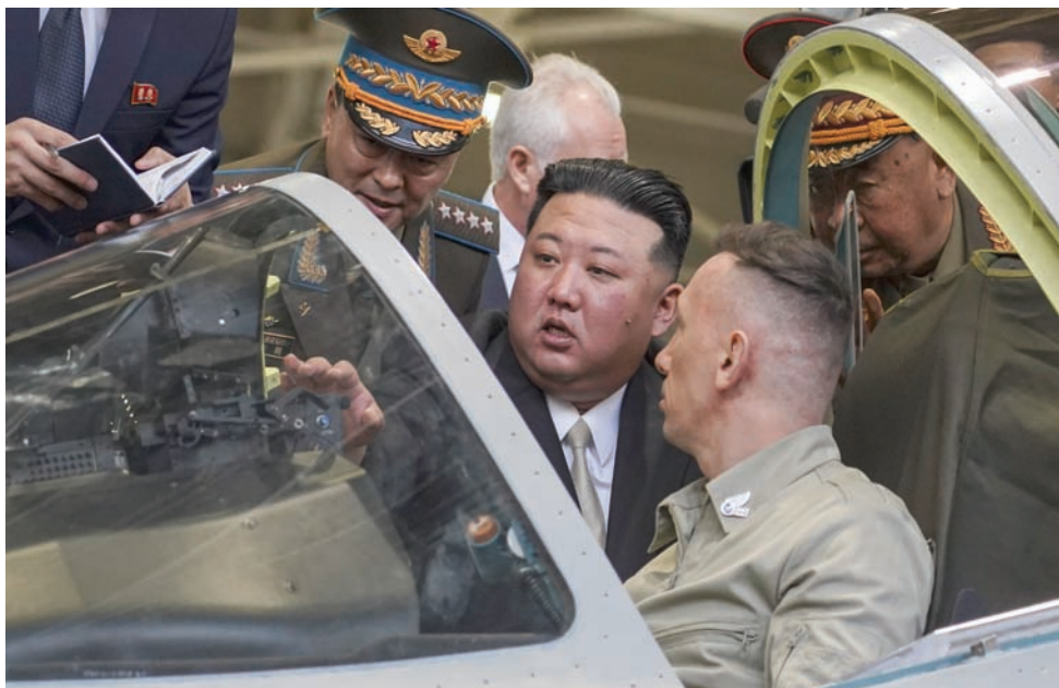
الزعيم الكوري الشمالي يزور مصنعاً للطائرات في منطقة أمور

عدة مجلس الأمن الدولي بما فيها قرارات صوتت روسيا نفسها لصالح تبنيها». وذكر مسؤول حكومي ياباني رفيع الجمعة، أن رئيس الوزراء فوميو كيشيدا مستعد للقاء كيم «من دون شروط مسبقة».