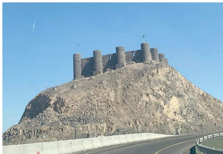
قلعة عسفان كما تبدو على الطريق السريع (بلدية عسفان)