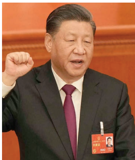
الرئيس الصيني شي جينبينغ

على أعضاء «مجموعة العشرين» وتوسع دول غير أعضاء. وكان زيلينسكي قد خاطب زعماء المجموعة عبر رابط فيديو خلال قمة بالي السابقة في إندونيسيا عام 2022. أما نيودلهي، فقد وقعت إلى جانب حليفها القديمة موسكو في مواجهة كييف. ورأى مراقبون أن قرار الهند ألا تدعو الرئيس الأوكراني جاء بوصفه خطوة تتعمد تجنب إزعاج روسيا التي تتقاسم «شراكة استراتيجية خاصة و متميزة» مع الهند. إلا أن زيلينسكي، في أي حال، أعرب عن خيبة أمله إزاء إعلان القمة، وقال إن الإعلان لا يعكس حقيقة العدوان الروسي ضد أوكرانيا، ولم يقدم أي دعم ملموس لأوكرانيا، ولم يفرض عقوبات ضد موسكو.