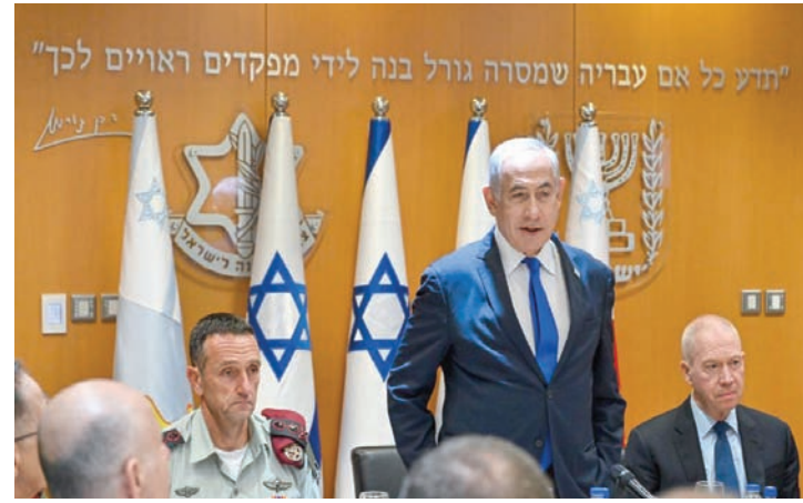
غالانت ونتنياهو وهليفي وهنغبي يحتفلون برأس السنة العبرية في مكتب الصحافة الحكومي

في وقت تشهد العلاقات بين الحكومة الإسرائيلية وقيادة جيشها وبقية الأجهزة الأمنية فيها توتراً، قام رئيس الوزراء، بنيامين نتنياهو، بجولة على مقراتها وراح يشيد بنشاطاتها و«سهرها على أمن إسرائيل ليل نهار». وإذ جرت اللقاءات بعد ساعات من تنفيذ غارات على أهداف في سوريا، لمح وزير الدفاع، يوآف غالانت، إلى مسؤوليه جيشه عن تلك الهجمات.