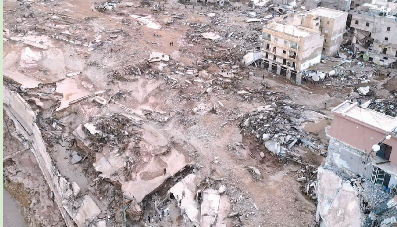
لقطة من الجو تظهر حجم الدمار في مدينة درنة أمس

ضحايا الفيضانات في مقابر جماعية، قاتلة إن هذا قد يتسبب في مشكلات نفسية طويلة الأمد للعائلات، أو قد يحدث مخاطر صحية إذا كانت الجثث مدفونة بالقرب من المياه العذبة.