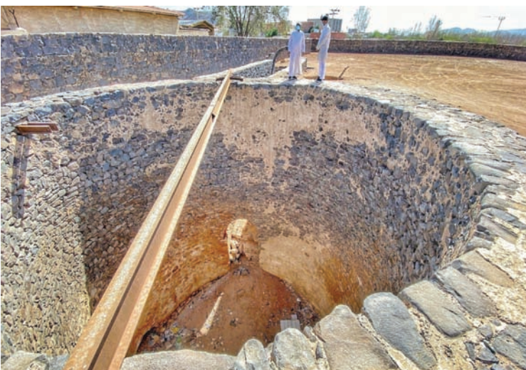
إحدى الآبار القديمة في المدينة التي تشتهر بكثرة وديانها