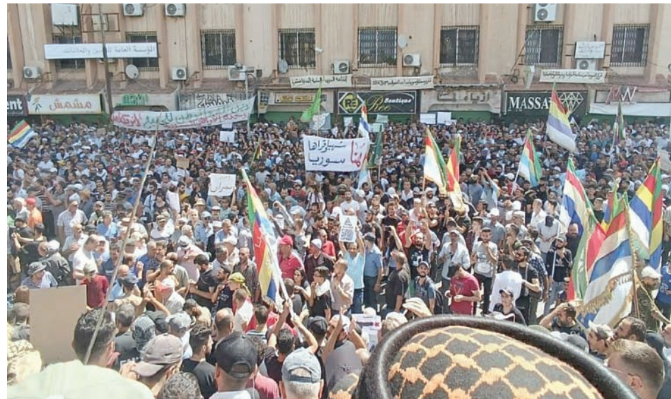
من الاحتجاجات في الساحة المركزية بمدينة السويداء أمس الجمعة

واحتشد الآلاف من أهالي محافظة السويداء في ساحة السبير وسط المدينة قادمين من بلدات وقرى