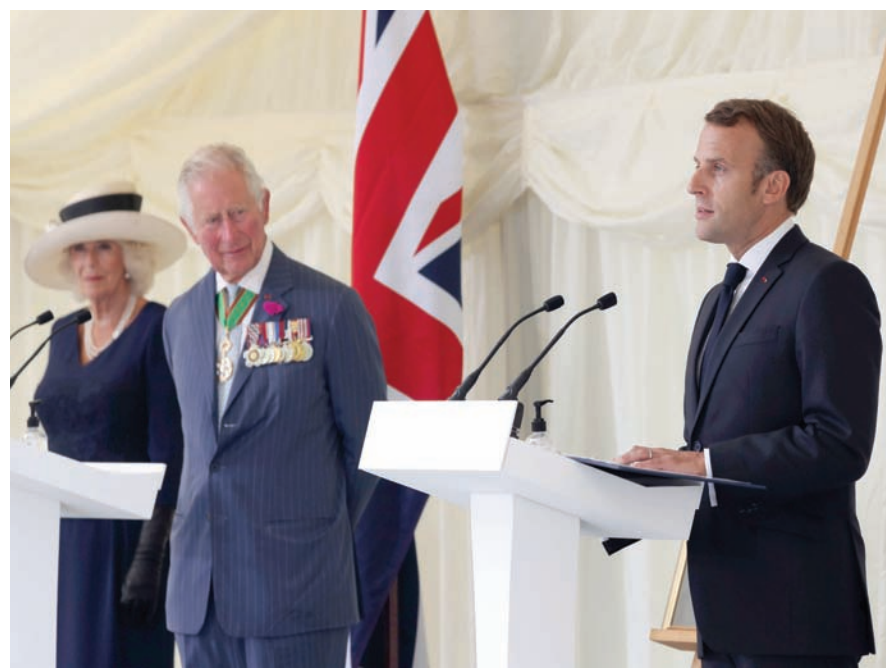
ماكرون يلقي خطاباً في لندن بحضور تشارلز وكاميليا في 2020

الاربعاء، تحت قوس النصر الذي بدأ بناؤه زمن الإمبراطور نابليون الأول، خصم التاج البريطاني في بداية القرن التاسع عشر، نقطة الانطلاق لثلاثة أيام من تكريم الخناثي الملكي، حيث سيعرف الشهيدين الوطنيين البريطاني الفرنسي، والوقوف دقيقة صمت؛ حداداً على الموتى وتحية الغلمين، وكتابة كلمة في الكتاب الذهني لقوس النصر. واستعراض القوة العسكرية المولجة لتقديم التحية، ثم نزول جادة الشانزليزية في سيارتين رفيعان الغلم الفرنسي؛ الأولى لماكرون وشارلز الثالث، والثانية لسيدة فرنسا الأولى بريجيت والملكة كاميليا. وسيشهد اليوم الأول من الزيارة لقاء مغلقاً بين ماكرون وشارلز الثالث في قصر الإليزيه. وقالت المصادر الرئاسية إنه سيتناول العلاقات الخناثية الفرنسية البريطانية ومستقبلها والأزمات الدولية، ومنها الحرب في أوكرانيا، والوضع في منطقة الساحل، فضلاً عن الموضوعات التي يتمسك العاهل البريطاني بما يعاينها مثل الذكاء الاصطناعي، التي ستنظم الجانب البريطاني قمة بشأنها في لندن، خلال نوفمبر