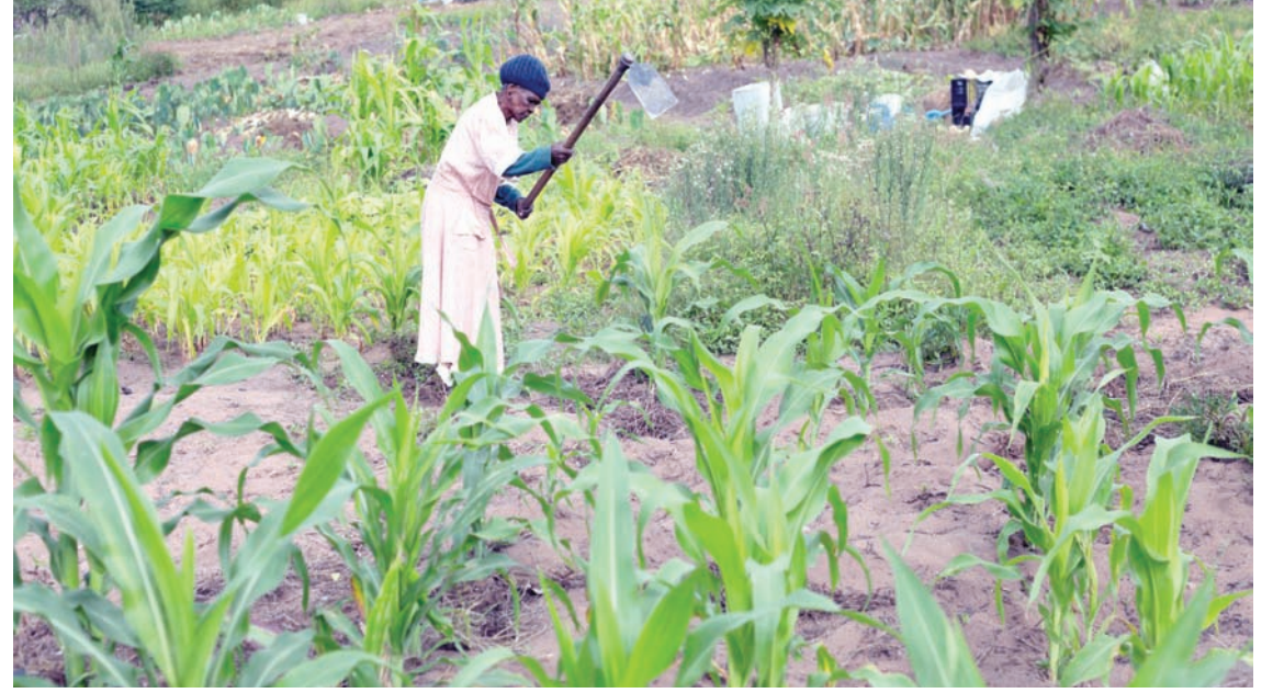
امراة تعمل في حديقة خضراوات مشتركة في كواندينجيزي بجنوب أفريقيا