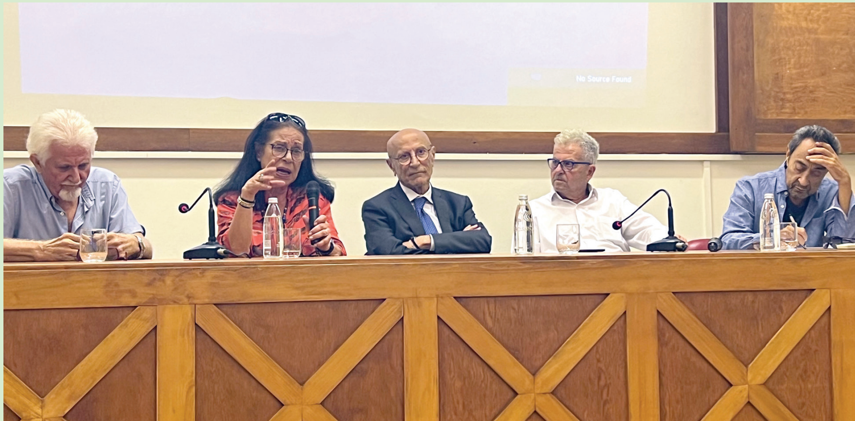
المتحدثون الخمسة في الندوة... الأوفياء بذاكرتهم لمنير أبو ديس

شمل النقاش ملاحظات المتحدثين حول مراحل مسرح المكرم باستعادة سيرته، وخط على تأثره بالطقسية والمسرح الإغريقي. أشار طريبه إلى الاندماش، ندوة عطاءات الممثل، وأخير بو نصار قصة الربيع ليرة إلى المنارة: «هذه تكلفة سيارة الأجرة للوصول إلى مدرسة أبو ديس. بجانب الحديقة المسورة بالأشجار، سكن البحر. لا تزال مفتوحة بغرفة الملابس، حيث أزياء جميع الشخصيات. فقدناها مؤسف».