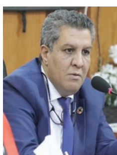
موسى المقريف وزير التربية والتعليم بحكومة الوحدة الوطنية في ليبيا