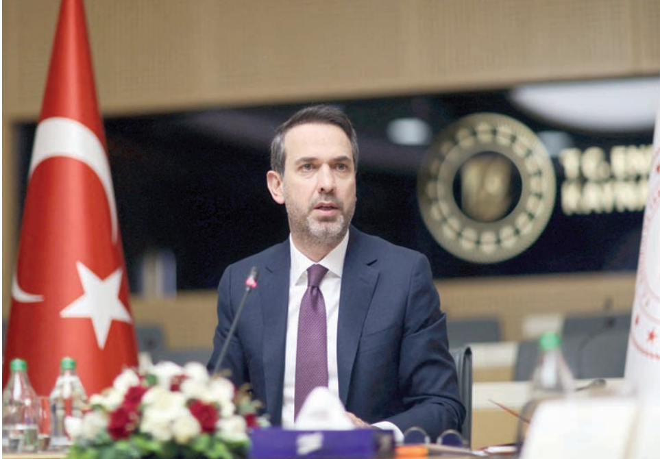
وزير الطاقة التركي ألب أرسلان بيرقدار يتحدث في مؤتمر صحفي مساء الخميس بآنقرة

وقال بيرقدار: «نود إنشاء نظام بيئي نووي أوسع في تركيا... نحن بحاجة إلى الطاقة النووية من أجل التحول العام للطاقة النظيفة بحلول عام 2050»، وهو الموعد الذي تتوقع فيه تركيا أن يكون اقتصادها، البالغ نحو 900 مليار دولار، خالياً من الكربون.