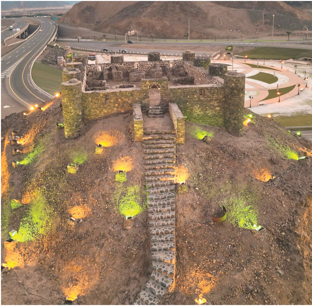
قلعة عسفان على مدخل المدينة للقادمين من جدة (بلدية عسفان)

وللرياضة والفنون حضورهما ضمن أعمال البلدية من خلال إنشاء ملعب لكرة القدم بمواصفات دولية، كما أنشأت البلدية مركزاً حضارياً ومسرحةً خاصاً به، و4 مصليات للأعمام، بالإضافة إلى العديد من الآبار القديمة المطوية بالحجر، وتتميز عسفان بهوائها النقي لكونها محاطة بجبال تصد عنها تيارات الغبار، وأرضها الزراعية الخصبة من الأسباب