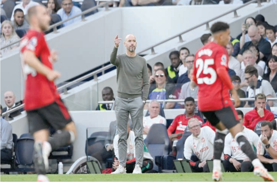
تن هاغ مطالب بوقف يونايتد لنزيف النقاط والخروج من لقاء برايتون بنتيجة إيجابية

مانشستر سيتي اتقن هذا الفن. وسيبدأ سيتي الدفاع عن لقبه الأوروبي الأسبوع المقبل على أرضه أمام رد ستار بلغراد، لكنه لا يتوقع أن يُبعد عينيه عن مباراة وستهام يونايتد اليوم.