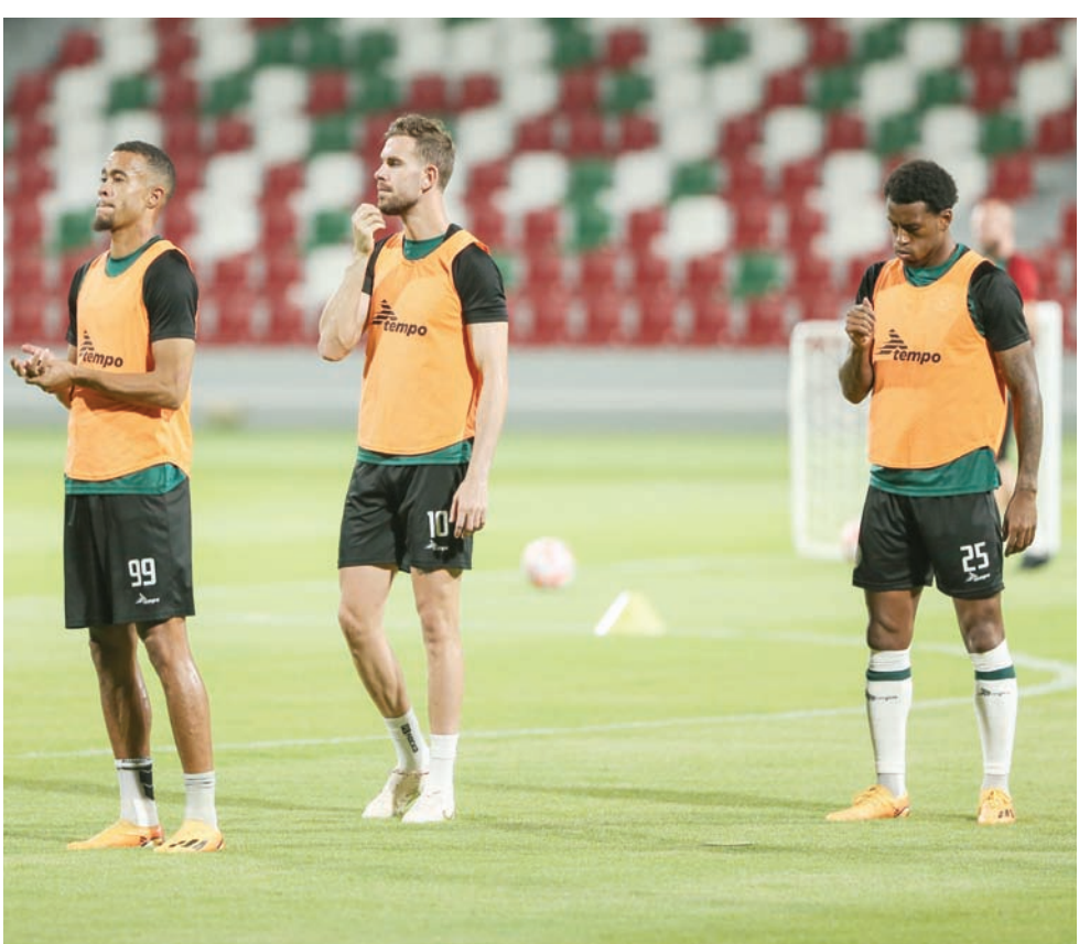
من استعدادات «فارس الدهناء» لمواجهة أبها

يذكر أن الاتفاق جمع 10 نقاط من 5 مباريات، حيث فاز في 3 وتعادل أمام الخليج وخسر أمام الهلال.