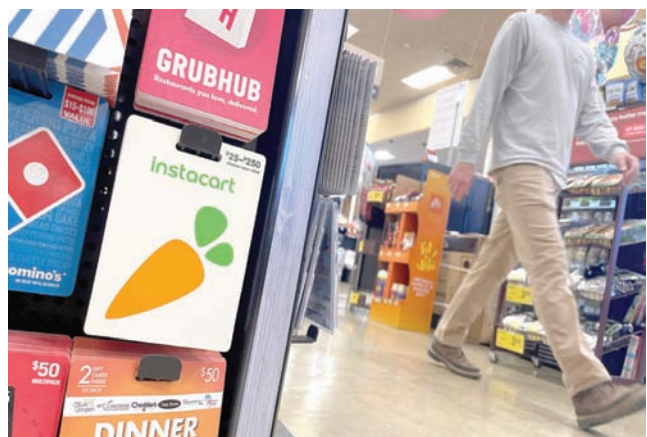
رجل يعشي في أحد المتاجر بولاية كاليفورنيا الأمريكية فيما يبدو على الحاجز إعلان تطبيق «إنستاكارت»، لتتواصل البقالة