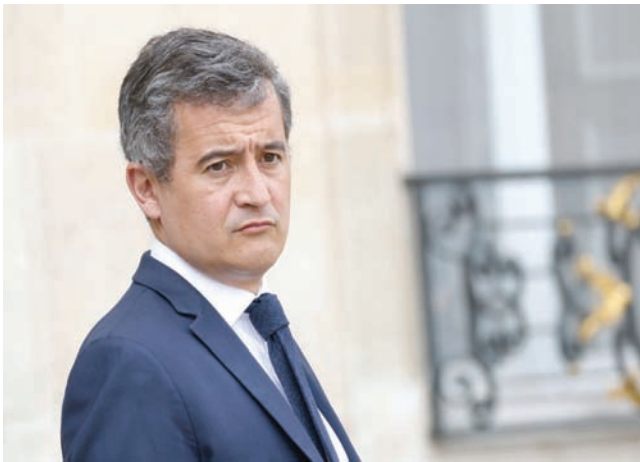
جيرالد درمانان

ضمن قائمة لأثة المحظورات التي قد يعاقب عليها «قانون مناهضة الانعزالية الإسلامية». على صعيد آخر، أثار هذا القانون ردود فعل غاضبة على المستوى الخارجي، لا سيما بعد خطاب ماكرون الذي قال فيه إن «الإسلام ديانة تعيش أزمة في كل مكان في العالم»، ويذكر أن القانون كاد يتسبب في أزمة دبلوماسية بين باريس وأنقرة، حين وصفه الرئيس التركي رجب طيب أردوغان بأنه «ضربة مقلصة في حق الديمقراطية الفرنسية»، ونددت به عدة جمعيات حقوقية، كمنظمة العفو الدولية، إن عدت الناطقة الرسمية باسمها، أن صوفي سيمبار، القانون، «تعسفاً». أيضاً كشف موقع «ميديا بارت» الإخباري المستقل أن هذا القانون تسبب إلى غاية الآن في وقف نشاطات عدة جمعيات خيرية ومجلات يديرها المسلمون، إضافة إلى إغلاق عدة مدارس قرآنية ومساجد، كما أخضعت آلاف المؤسسات الإسلامية للتحقيق، وأغلق 900 منها، بالإضافة إلى مصادرة أكثر من 55 مليون يورو.