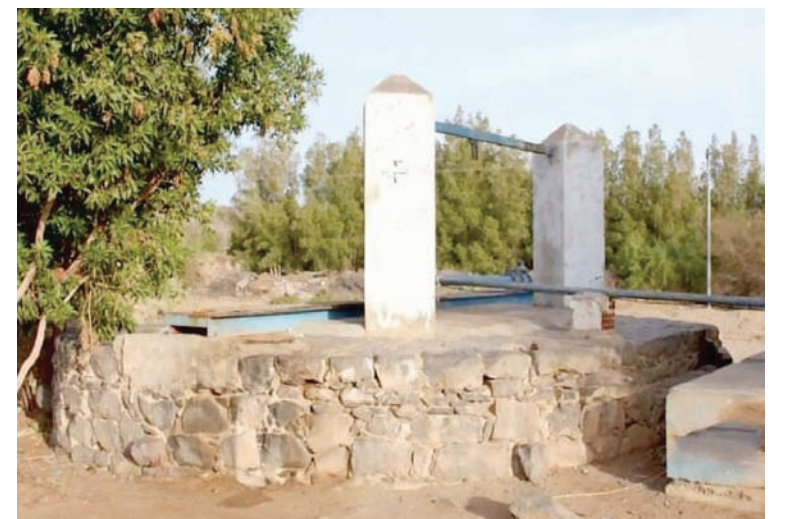
كثرة الآبار والأودية جعلت المدينة محطة رئيسية في عبور القوافل (بلدية عسفان)

«ميدفست مصر» يتناول علاقة الدراما بالصحة النفسية