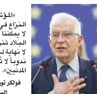
جوزيف بوريل، الممثل السامي للاتحاد الأوروبي للشؤون الخارجية

«إيمانويل ماكرون يسخر من العلمانية ويدوس على مبادئها، كما يسخر من الفصل بين الكنائس والدولة، ومن حياء الدولة تجاه الأديان... مع أن حكومتها، باسم هذه المبادئ نفسها، منعت ارتداء العباءة في المدارس».