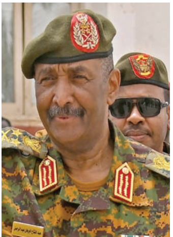
قائد الجيش عبد الفتاح البرهان