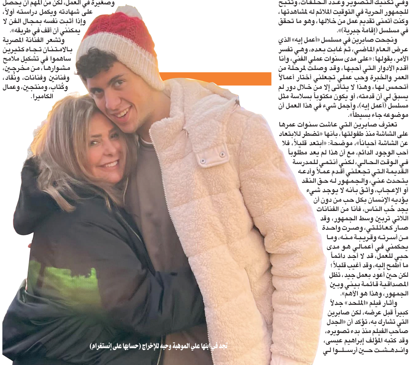
تجد في ابنتها على الموهبة وحبه للإخراج (حسابها على إنستغرام)

تشارك ضيفة شرف في فيلم «أبو نسب» مع محمد إمام