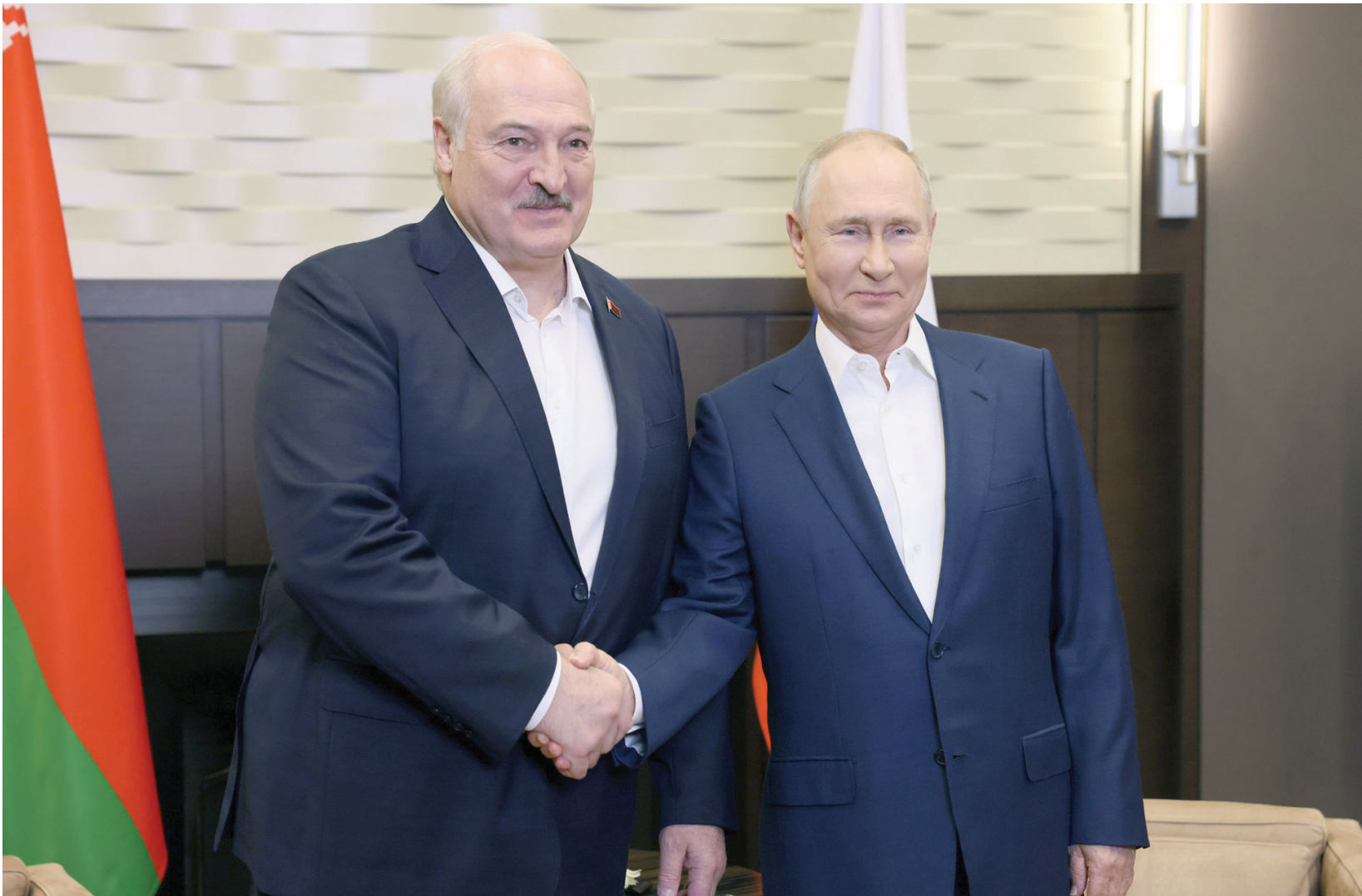
رئيس بيلاروسيا الكسندر لوكاشينكو مع حليفه الرئيس بوتين

وفي إشارة إلى أحد عناصر البحث الرئيسية، قال بوتين إن «روسيا وبيلاروسيا تتغلبان على ضغوط العقوبات. فيما يتعلق بالقبول التي يتم فرضها علينا: رفضت الشركات الأوروبية توريد المعدات، على ما يبدو، كانوا ياملون أن يكون لدينا ما يكفي من الكفاءات. لقد استعدنا جميع الكفاءات» كل شيء على الإطلاق. تم تغيير الجداول الزمنية قليلاً... وكشف الرئيس الروسي عن أنه «سيتم إنشاء شركتين ضخمة ذات نطاق عالمي في المستقبل القريب جداً». ملاحظاً أنه في الوقت ذاته «أوروبا تعاني من الخسائر».