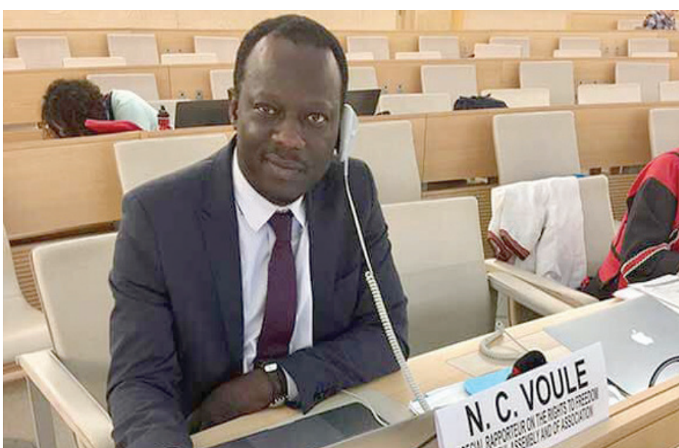
مقرر الأمم المتحدة لحرية التجمعات

وأعلن عن هذه الزيارة، التي تدوم عشرة أيام، بالموقع الإلكتروني لـ«المحافظة الأممية السامية لحقوق الإنسان»، التي أوضحت أن موفدها كلمنت نياليتسوسي فول «سيجري معارضة حول حالة التجمع السلمي وتكوين الجمعيات، بما في ذلك الإطار المعياري القائم للتمتع بهذه الحقوق، والتقدم المرز والتحديات والعقبات والتوقعات». وفي أثناء تنقلاته المرتقبة إلى بجاية (شرق)، ووهران (غرب)، بعد عاصمة البلاد، سيبحث المقرر الأممي، حسب «محافظة حقوق الإنسان»، التدابير المتعلقة بتنظيم المظاهرات السلمية، ومدى