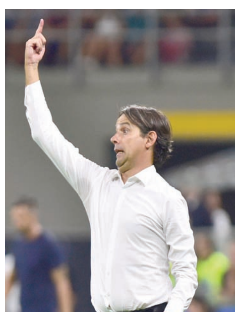
إنزاغي مدرب إنتر