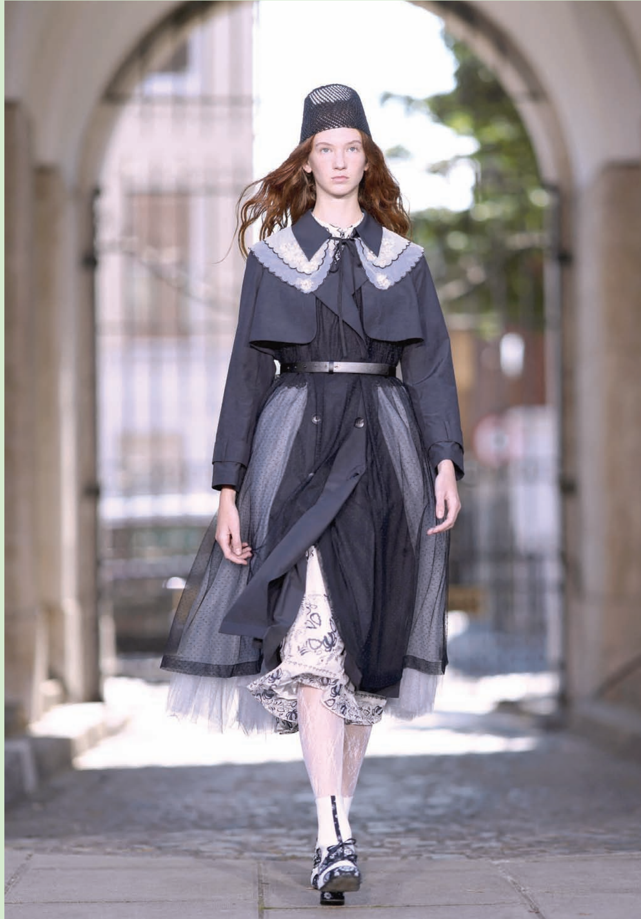
عارضة تقدم تصميماً في عرض أزياء بورا أكو خلال أسبوع الموضة في العاصمة البريطانية لندن

يقال إن هناك 5 تفاحات غيرت تاريخ العالم. الأولى أكلها آدم فأخرجته من الجنة، والثانية وقعت على رأس (نيوتن) فاكشف الجاذبية، والثالثة (ستيف جوبز) جعلها شعار لشركة (apple)، أما الرابعة والخامسة فقد عمل منهما العرب (معسل أبو تفاحتين).