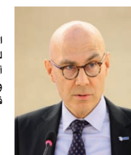
فولكر تورك، مفوض الأمم المتحدة السامي لحقوق الإنسان