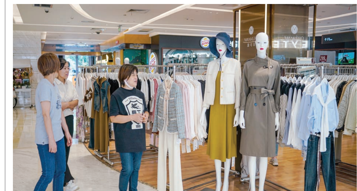
صينيون يتسوقون في أحد المتاجر الكبرى وسط العاصمة الصينية بيكين

وقال المشاركون في السوق إن أداء «آرم» القوي يشير إلى أن طلب المستثمرين على الطروح العامة الأولية، التي تضررت بشدة خلال