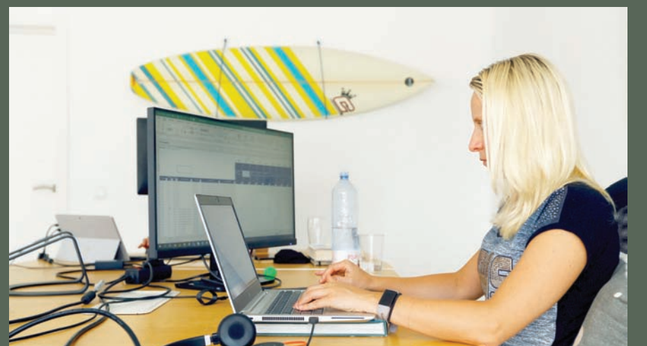
امرأة تعمل على مكتبها خلف شاشة الكمبيوتر

تأخذ رأياً يتوافق مع وجهة نظرك، أو الصراخ لتوصيل فكرتك. ما يجب فعله بدلاً من ذلك: ثم التعامل مع الانزعاج الذي تشعر به بدلاً من محاولة التخلص منه. وتوضح: «إذا تلقيت تشخيصاً مقلماً من طبيب، على سبيل المثال، وكان لديك عادة قضاء ساعات في البحث عن تفسيرات بديلة على الإنترنت، فحاول قضاء دقيقة أو دقيقتين في الجلوس مع انزعاجك». وتتابع: «خذ أنفاساً عميقة قلبية، وحاول تسمية الأحاسيس الموجودة في جسمك. ربما لا تزال المشكلة موجودة، ولكن سيكون لديك دماغ وأفكار أكثر وضوحاً للتعامل معها».