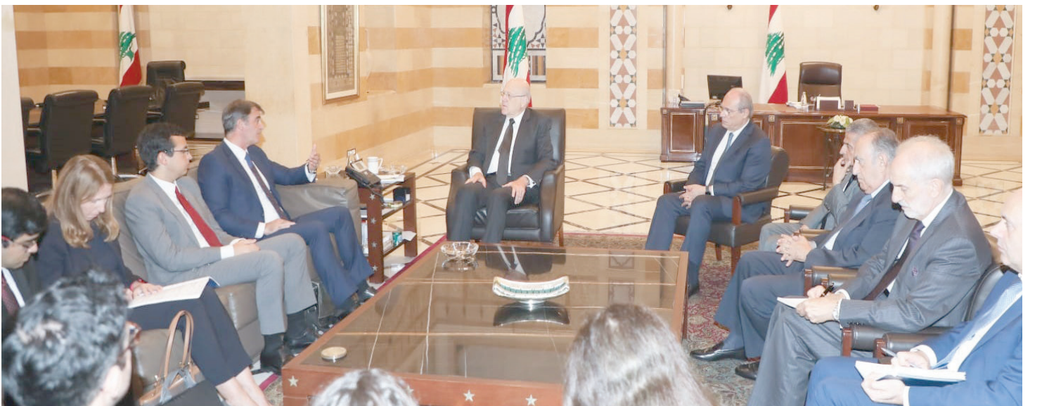
مبعثاتي مجتمعاً مع بعثة صندوق النقد الدولي برئاسة رئيس البعثة أنستور ريفا (أ.كس)