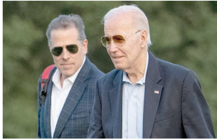
الرئيس جو بايدن مع ابنه هنتر بوشنن في 25 يونيو 2023

«بدلاً من ذلك، كثّف مسؤولون جمهوريون حضورهم الإعلامي ومقابلاتهم لوصف بايدن بالكذب والاحتيال»، الأمر الذي قرر المدافعون عنه اعتماده أيضاً للرد على تلك الاتهامات.