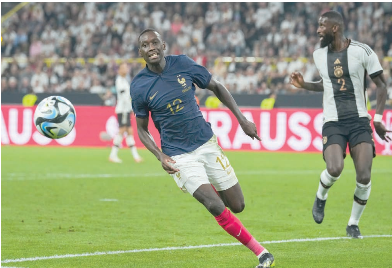
كولو مواني مرشح بقوة ليكون رأس الحربة الجديد لمنتخب فرنسا خلفاً لجيرو

لعب مع مبابي وديمبيلي في سان جيرمان ويمكن أن يكون هذا الثلاثي هو خط هجوم المنتخب أيضاً