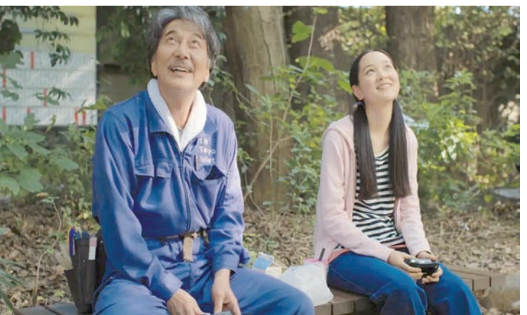
«برفكت دايز» (ماستر مايند)

ذلك الذي توفّره بلانشيت، لكن مرة أخرى، الفيلم الذي ينحج بسبب عنصر واحد لا يمكن أن يُنظر إليه كعمل متكامل.