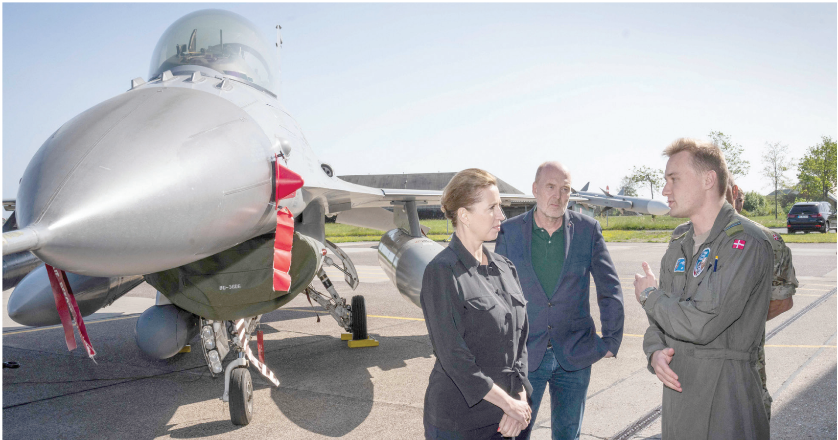
رئيسة وزراء الدنمارك تفتت أمام «إف 16» التي قررت إدارة باينز تزويد أوكرانيا بها بعد تردد