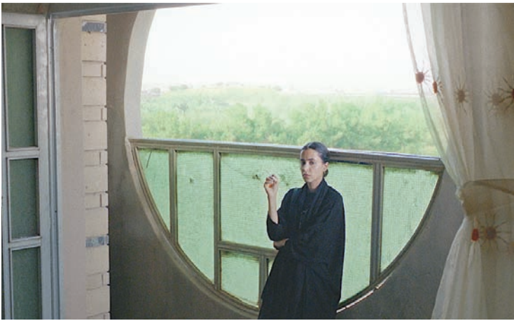
من الفيلم السعودي «ناقة» (مهرجان تورونتو)