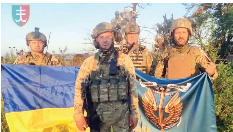
جنود أوكرانيون في قرية أوروزخين جنوب شرقي البلاد الأربعاء

كانت التوقعات بشأن هجوم أوكرانيا المضاد مرتفعة للغاية منذ البداية. لكن الحلفاء أنفسهم يتحملون أيضاً المسؤولية عن التقدم البطيء الذي حققته القوات الأوكرانية، منذ إطلاقها الهجوم الذي تاخر أصلاً عن مواعده الأولى، من الربيع إلى بداية الصيف. وبحسب تقرير أميركي في صحيفة «بوليتيكو»، فإن الهجوم المضاد الذي يقرب من إنهاء شهره الثالث، مع عدم وجود أي علامة على حدوث تقدم كبير في التغيير الديناميكي، يشير إلى أن الأمور عادت إلى الوراء. حرب استنزاف تخاطر بإرهاق صبر الحلفاء، وهو أمر لا شك في أن الكرملين يأمل في حصوله. يقول إدوارد لوتواك، في الاستراتيجي العسكري الأميركي، إن الحرب الأوكرانية دخلت فترة «الشاهدة والتحمل»، بعدما حاولت قوة غظمي وفشلت في التغلب على