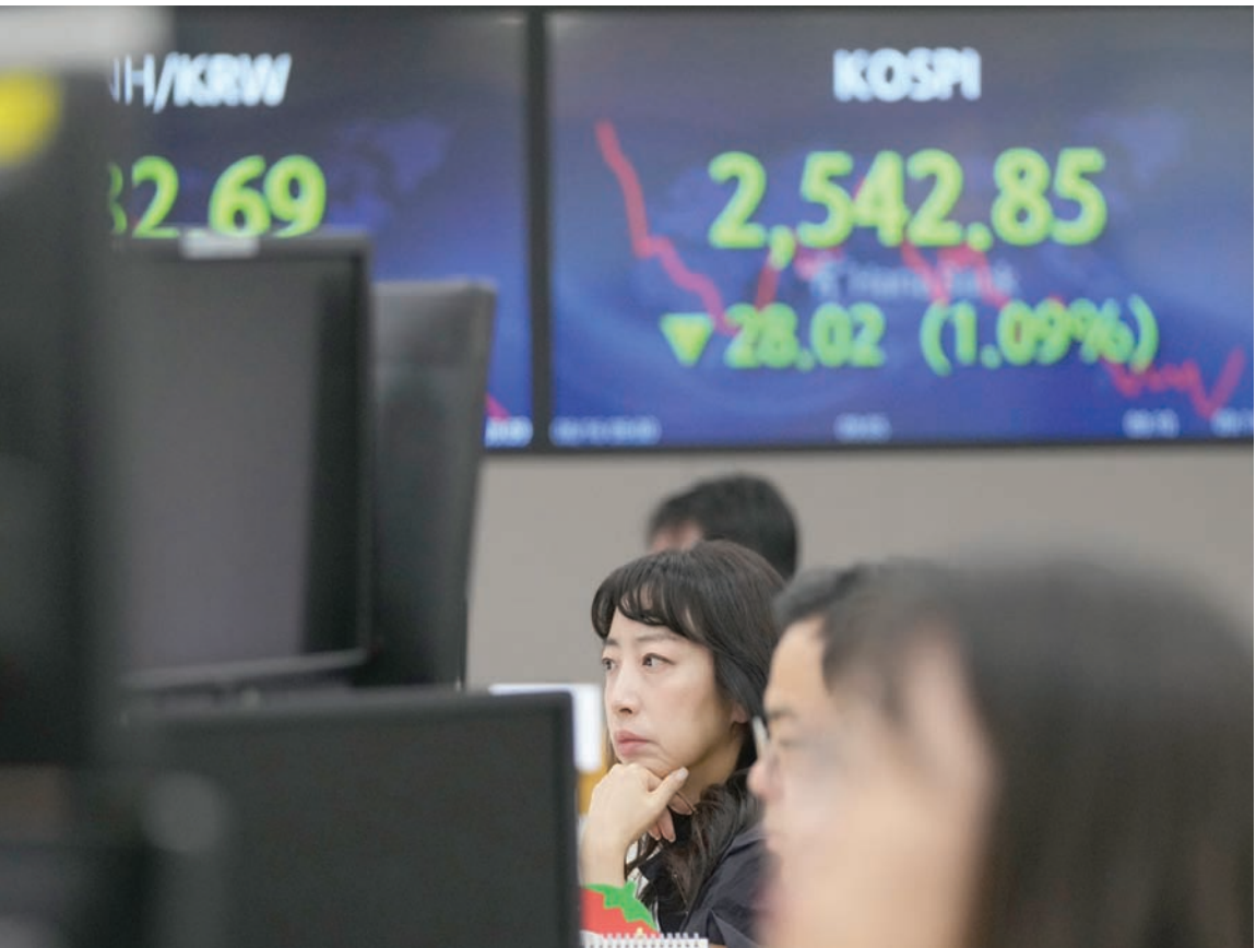
متداولون في البورصة الكورية بالعاصمة سيول يتابعون حركة الأسهم بينما تزداد الضغوط في الأسواق

توقعت بأن أسعار الفائدة ستظل مرتفعة لفترة أطول. وفتحت عوائد السندات في أنحاء أوروبا مع ارتفاعها بشكل حاد في إيطاليا