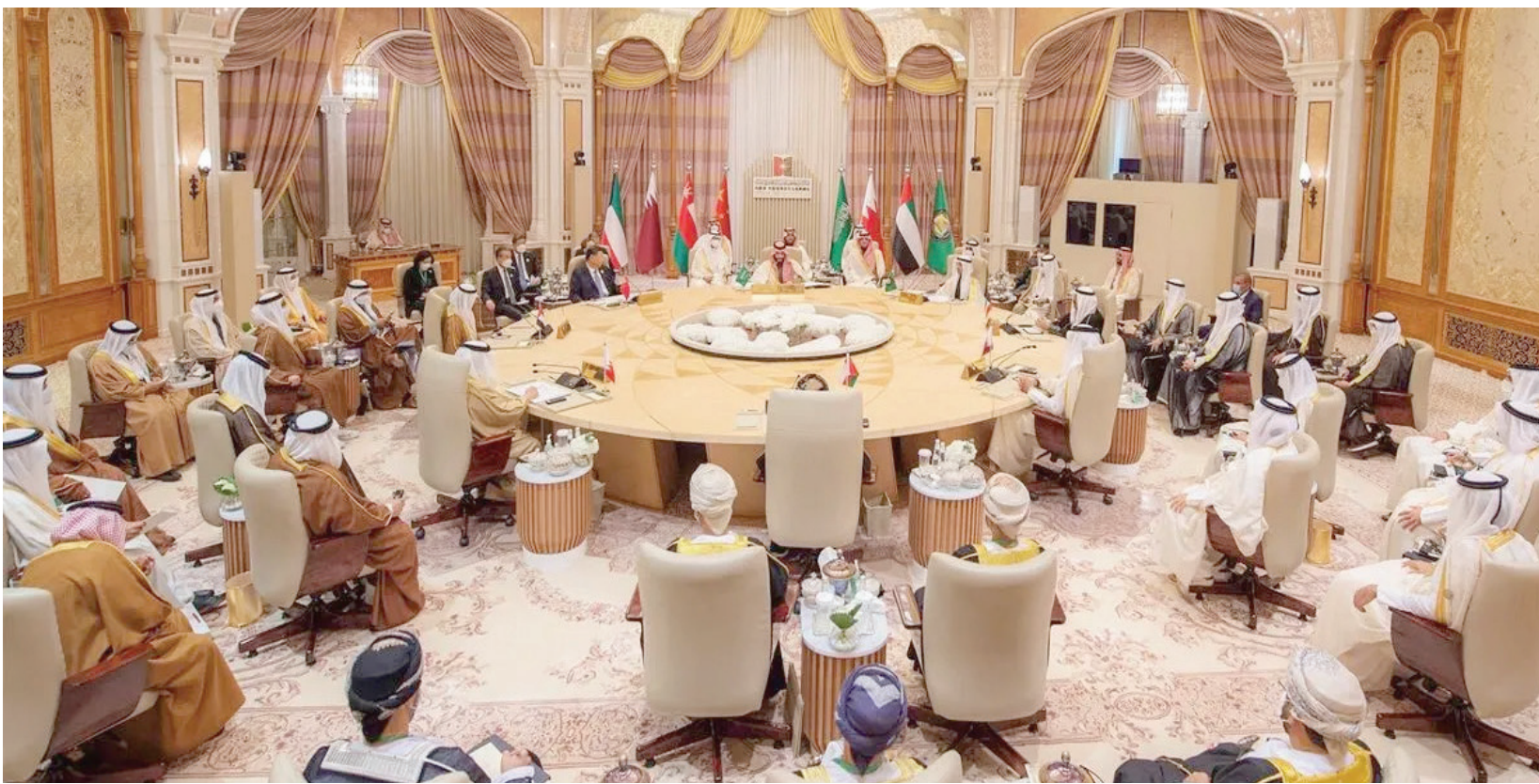
الأبهر محمد بن سلمان ولي العهد السعودي خلال تروؤسه «قمة الرياض الخليجية - الصينية للتعاون والتنمية» مع الرئيس الصيني شي جينبينغ في ديسمبر الماضي

ويشير التقرير، أن شرارة العلاقات الكبرى بدأت مع النمو الاقتصادي السريع للصين الذي أدى إلى زيادة كبيرة في الطلب على الطاقة، وبالتالي كان هناك انتعاش خليجي هائل في الطلب على السلع الاستهلاكية من الصين. وأوضح أن إجمالي التجارة بين الصين ومنطقة الشرق الأوسط بلغ 505 مليارات دولار في عام 2022، ونسبة نمو قدرها 76 في المائة عن مستوياتها قبل 10 سنوات. وكان من اللافت أن إجمالي التجارة بين الصين ودول الخليج وحده تضاعف 3 مرات خلال تلك الفترة، لكن التقرير الذي أسهمت في إعداده شركة «أوليفر وإيمان» للاستشارات، يؤكد في الوقت ذاته، أن الروابط الاقتصادية بين المنطقتين «أكثر بكثير من مجرد