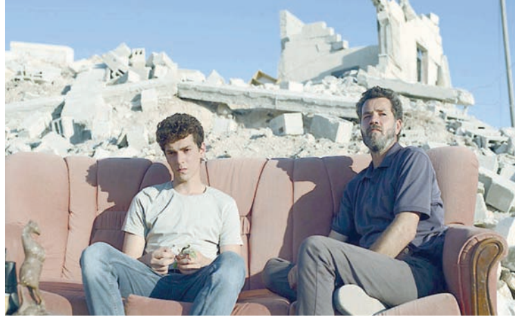
«المعلم» لفرح نابلسي (مهرجان تورونتو)

كانت المخرجة اللبنانية نادين لبكي قد فازت بجائزة الجمهور في مهرجان تورونتو سنة 2011 عندما قدمت فيلمها «وهاولين». في عام 2018 فازت بجائزة لجنة التحكيم في مهرجان «كان» عن فيلمها الأخير حتى الآن وهو «كفرناحوم». ظهرت في نحو 19 فيلماً كممثلة آخرها (1982) لوليد مؤنس و«كوستا برفا، لبنان» لمخية عقل (2021) و«أصحاب ولا أعز» لوسام سمايرة. تتقّم اللجنة ثلاثية الأفراد عشرة أعمال من أفلام تورونتو بينها فيلم نورا الحورش «سبسترهود» لدى نادين لبكي مشروع فيلم جديد لا يزال في طور التطوير عنوانه «غير المرحبين». كوّنت نادين لبكي لنفسها اسماً عالمياً منذ أن قدمت أول أفلامها «كرامل» سنة 2007.