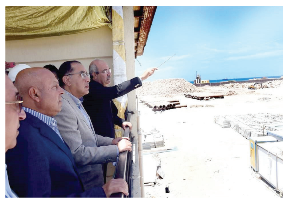
رئيس الوزراء المصري مصطفى مدبولي يتفقد أحد الموانئ في يونيو الماضي (أرشيفية - مجلس الوزراء المصري)

وقال غنوري في إفادة رسمية، الخميس: إن «تشديد إجراءات الرقابة على المنافذ الجمركية، أسهم في الحد من محاولات التهريب، والحفاظ على حقوق الخزانة العامة، وحماية الصناعة الوطنية، والمجتمع