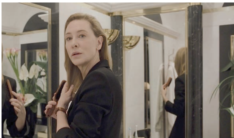
كيت بلاشيت في «تار»

● هذا الكلام يمر من دون تعليق، لكن تصوّر لو قاله ناقد عربي، الأمر الراجح والجميل حول «الحقيقة» هو أنها إذا لم تُعامل هكذا توارت وبالتالي لم يستفد منها أحد. بعض النقاد العرب يدركون ذلك مزاراً أكثر من النقاد الأجانب خصوصاً في سينماهم، لكنهم يخشون ردة الفعل.