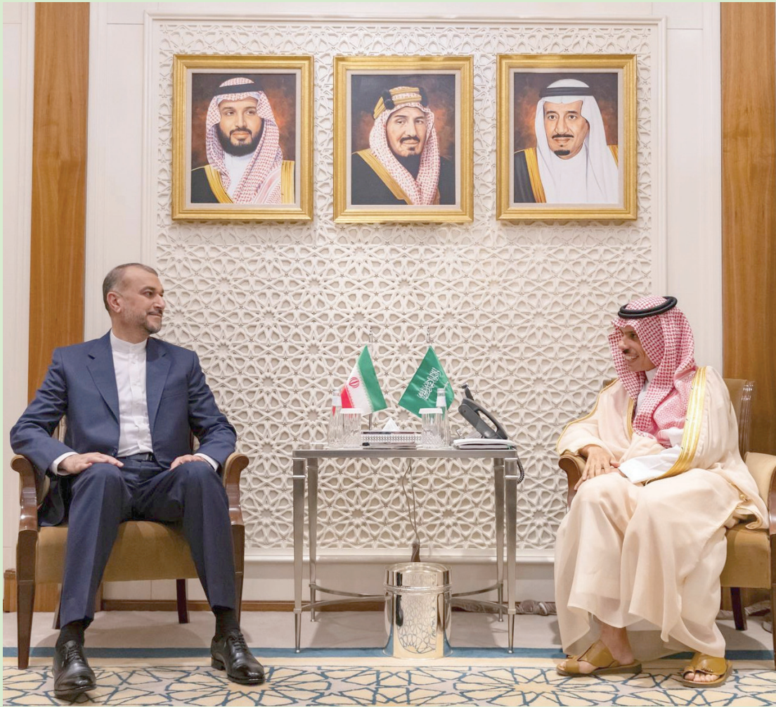
الرياض: عبد الهادي جيتور عقد وزير الخارجية السعودي الأمير فيصل بن فرحان ونظيره الإيراني حسين أمير عبداللهيان خلال اجتماعهما في الرياض أمس (واس)

عقد وزير الخارجية السعودي الأمير فيصل بن فرحان ونظيره الإيراني حسين أمير عبداللهيان محادثات رسمية، في الرياض، أمس الخميس، شددوا خلالها على إطلاق مرحلة جديدة بين البلدين تتسم بتعزيز التعاون الثنائي بما يخدم المصالح المشتركة والاحترام المتبادل والأمن الإقليمي. وأعلن الأمير فيصل بن فرحان، خلال مؤتمر صحافي عقد في مقر الخارجية السعودية، أن خادم الحرمين الشريفين الملك سلمان بن عبد العزيز وجه دعوة إلى الرئيس الإيراني إبراهيم رئيسي لزيارة المملكة. وحث الوزير السعودي استئناف بعثات البلدين أعمالها، ومباشرة السفيرين مهامهما خطوة أخرى لتطوير العلاقات بين البلدين، كما أكد حرص الرياض على بحث سبل تفعيل الاتفاقيات السابقة خصوصاً تلك المتعلقة بالجوانب الأمنية والاقتصادية.