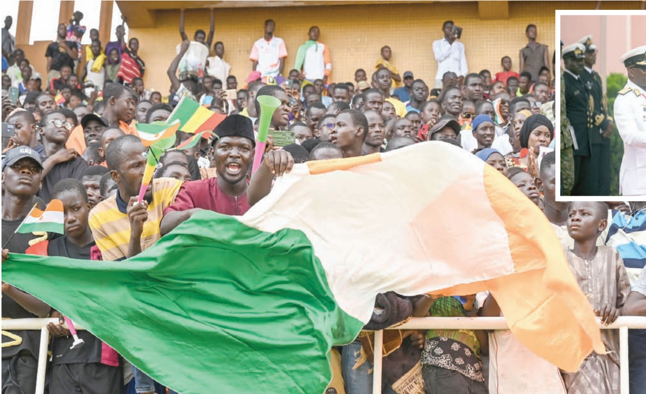
أعضاء المجلس العسكري يحملون أعلام النيجر ومالي في نيامي

وتنفي فرنسا، القوة الاستعمارية السابقة، اتهامات المجلس العسكري بأنها تسعى لزعة استقرار البلاد، أو أنها انتهكت مجالها الجوي، وقالت إنها تدعم جهود «إيكواس» لاستعادة