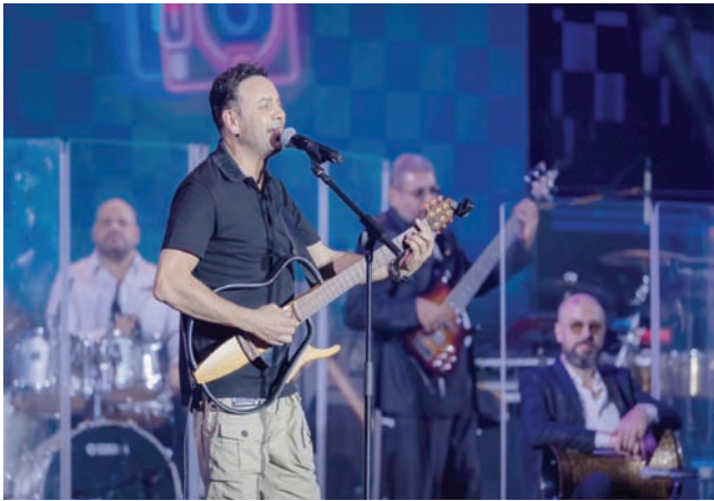
الفنان مصطفى قمر يغني «السود عيون» (الجهة المنظمة)

وكتب الشاعر والملحن المصري عزيز الشافعي عبر حسابها بموقع «إكس» قائلاً: «الحفل عظيم وتكريم كريم لجمهورنا أمعنونا وجبل ذهبي أثير الفن وصناعة الأغنية والتسعينات... ذكريات لا تنسى (وأغاني) رائعة وجمهور أروع. جزيل الشكر لهيئة الترفيه وشركة انبش مارك) والحضور الكريم». واستمرت السهرة حتى الثالثة فجراً بتوقيت السعودية، ضمن أجواء حماسية أيقظت أروع ذكريات زمن التسعينات.