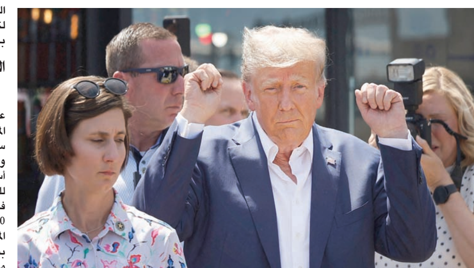
ترمب يحيي أنصاره في ألبا الأسبوع الماضي

ويبرز مايك بنس كحشد أهم الشخصيات في قضية جورجيا، رغم التزامه خلال السنوات الثلاث الماضية بتأكيد أن أفعال ترمب لم تكن جنائية. وانتقل نائب الرئيس السابق من رفض ادعاء الأخير سرقة الانتخابات، وأشار بنس توتراً في صفوف الجمهوريين بهذا الموقف، وقدم نفسه رجلاً ملتزماً بالقانون والدستور، وقال إنه «بينما طلب منه ترمب أن يختار بينه وبين الدستور الأميركي، اختار الدستور». وأعلن مراراً أن أي شخص يضع نفسه فوق الدستور يجب ألا يكون رئيساً للولايات المتحدة.