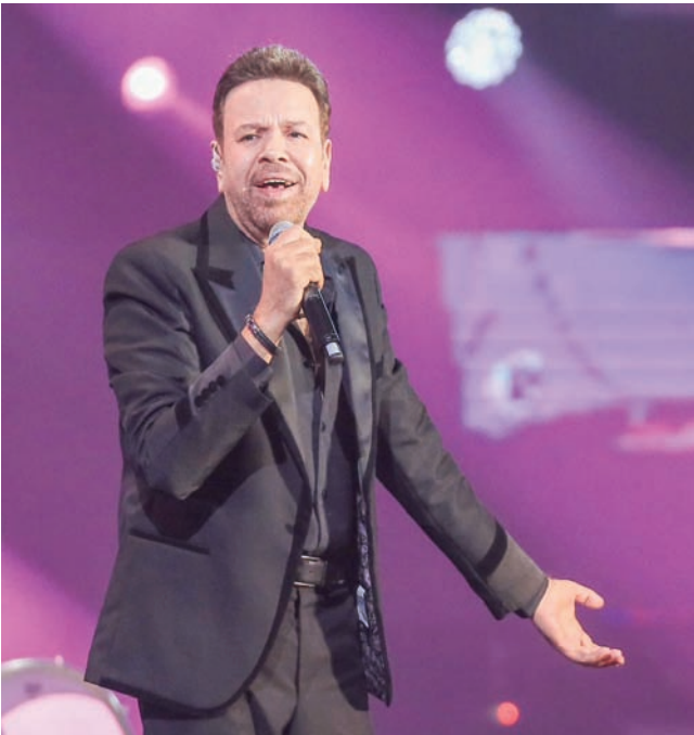
الفنان خالد عجاج يقدم أجمل أغنياته