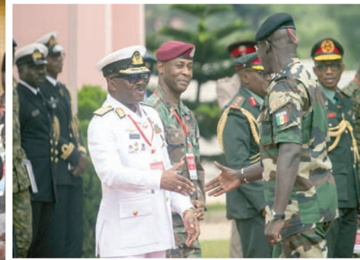
رئيس أركان غانا لدى استقباله قائدا عسكريا من السنغال في أكرا أمس

حشد ضد «إيكواس» وفي نيامي عاصمة النيجر، حيث شاركت حشود كبيرة في احتجاجات ضد «إيكواس» ولدعم قادة الانقلاب، رفض السكان فكرة التدخل الخارجي لإعادة الرئيس