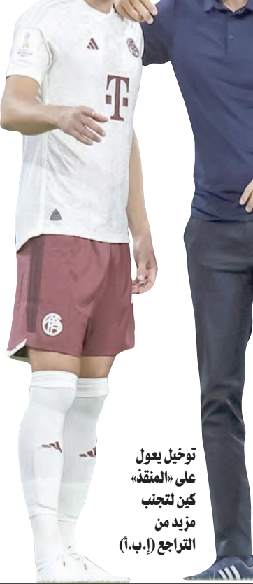
توخيل يعول على «المفتق» كين لتجنب مزيد من التراجم

وضم دورتموند 3 لاعبين هذا الموسم، وهم الجزائري رامي بن سبعيني القادم في صفقة انتقال حر من بوروسيا مونشنغلاخ، وفيليكس نميشا لاعب وسط فولفسبورغ، والنمساوي مارسيل