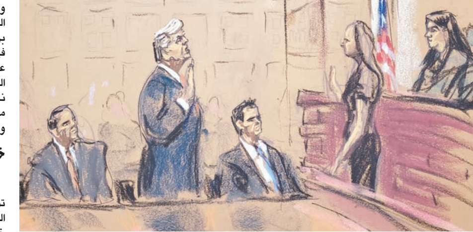
رفض ترمب تهم التآمر لقلب نتائج انتخابات 2020 أمام محكمة بواشنطن في 3 أغسطس

انخفاض مستويات المشاهدة في غيابه. وتأهل للمشاركة في المناظرة 8 مرشحين، بينهم ترمب، يليه رون ديسانتنيس حاكم ولاية فلوريدا، ونيجي هالي سفيرة الولايات المتحدة السابقة لدى الأمم المتحدة، وفيفك راماسوامي رجل الأعمال، ودوغ بورغوم حاكم ولاية نورث داكوتا، وتيم سكوت السيناتور عن ولاية كارولينا الجنوبية. وتردده في مشاركة المسرح مع مرشحين يحصدون مستويات متدنية في استطلاعات الرأي. كما لم يتردد ترمب في انتقاد شبكة «فوكس نيوز»، التي تنظم المناظرة الجمهورية الأولى. وتدور في الكواليس محاولات لإقناع ترمب بالمشاركة خوفاً من