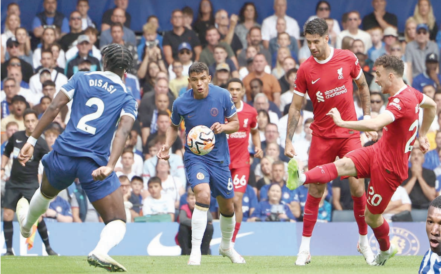
مواجهة ليفربول وتشيلسي في الجولة الافتتاحية أظهرت مدى احتياج «الريدز» لتدعيم خط الوسط

لخط وسط ليفربول الذي تم تدعيمه بالفعل من خلال التعاقد مع اليكسيس ماك اليستر ودومينيك سزوبوسلاي في فترة الانتقالات الصيفية الحالية، فقد بدا أن ليفربول قادر على حسم صفقة لافيا بدلاً من ذلك. يبلغ لافيا من العمر 19 عاماً، ولم يلعب إلا موسماً واحداً فقط في الدوري الإنجليزي الممتاز مع فريق ساوثهامبتون الذي هبط إلى دوري الدرجة الأولى، لذلك كان ليفربول يعتقد في البداية أنه سيكون إضافة طويلة الأمد ويمكن أن يتطور ويتحسن من خلال الاعتماد عليه لبعض الوقت إلى جانب فابينيو. لكن رحيل اللاعب البرازيلي جعل ليفربول في حاجة ملحة للتعاقد مع لافيا. رفض ساوثهامبتون ثلاثة عروض - كان الثالث بقيمة 45 مليون جنيه إسترليني - قبل أن يقرر ليفربول التركيز بشكل كامل على التعاقد مع كاسيدو. والآن، خسر ليفربول أمام تشيلسي مرة أخرى في صفقة لافيا، على الرغم من تقديم عرض مالي أكبر إلى ساوثهامبتون.