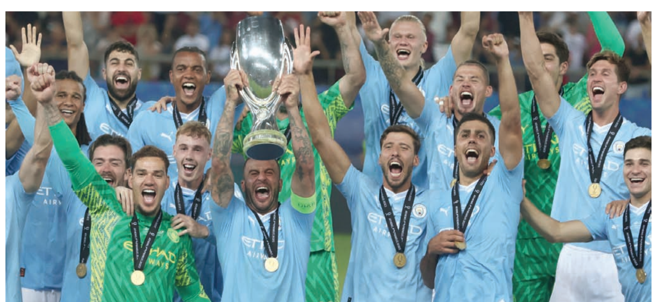
مانشستر سيتي وكأس السوبر (أ.ب.أ)

في وقت متأخر بدلاً من بالمر بالذات. وبالإضافة إلى مهمة الدفاع عن القابض في الدوري الإنجليزي الممتاز ودوري أبطال أوروبا وكأس إنجلترا، سيكون سيتي أمام مشقة خوض كأس الرابطة الإنجليزية بالإضافة إلى محاولة الفوز بكأس العالم للأندية من أول محاولة للنادي. وتحسّر غوارديولا لعدم حصول فريقه على الوقت الكافي للاستعداد للموسم الجديد، مسلطاً الضوء على كثرة الإصابات التي يعاني منها اللاعبين في أوروبا بأكملها رغم أن الموسم ما زال في بداياته. وقال غوارديولا قبل مباراة الكأس السوبر: «انظروا إلى جميع إصابات الرباط الصليبي التي حدثت في جميع البطولات الكبرى في بداية الموسم، اللاعبين لا يرتاحون جسدياً أو ذهنياً». وتابع: «يجبرونهم على السفر إلى آسيا أو أميركا (في جولات ما قبل الموسم) لأغراض النادي ويلعبون مباريات صعبة حقاً على ملاعب سيئة ويعترض