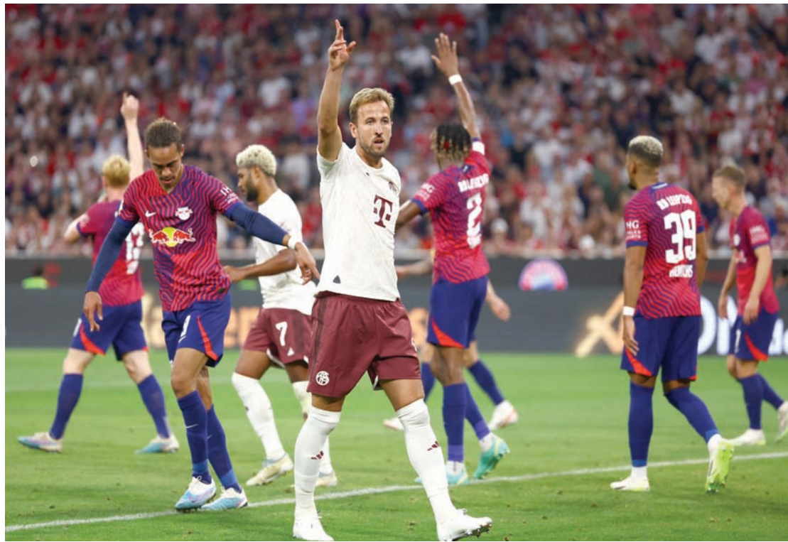
كين يبدأ مشواره مع بايرن ميونخ باحلام جديدة بعيداً عن توتنهام و13 عاماً

سابيتز من بايرن ميونخ. لكن الفريق رحل عنه عدد من اللاعبين مثل النجم الإنجليزي جود بلينغهام الذي انتقل إلى ريال مدريد الإسباني مقابل 103 ملايين يورو، بينما رحل محمود داود ورافاييل غويريرو إلى كولون (السبت)، حيث يأمل مدربه إيدن تريزيتش في ألا يكرر فريقه أخطاء الموسم الماضي.