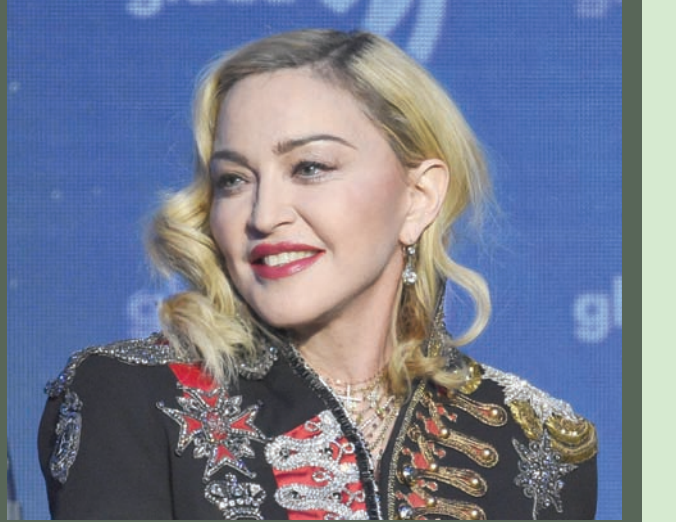
مغنية البوب الأميركية الشهيرة مادونا

وحثت مادونا جمهورها على التبرع لجمعية خيرية تساعد الأطفال الأيتام في دولة مالايو الأفريقية، وذلك بالتزامن مع