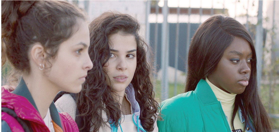
من «سبسترهود» لنورا الحورش (مهرجان تورونتو)

لكرتها: المعلم بشام (صالح بكري) يفقد ابنه ثم زوجته في حادثة. برطاني يعمل في الخدمات الإنسانية (إموجن بوتس) يتدخل للمساعدة بعدما تم هدم منزل عائلة عليها. يعمل ليل نهار ليعول والده ثم يطرد من عمله فيحاول بيع زجاجات خمر سرقتها من تاجر يصنعها محلياً بلا ترخيص. توابع ذلك كثيرة في فيلم اجتماعي من نوع الكوميديا السوداء.