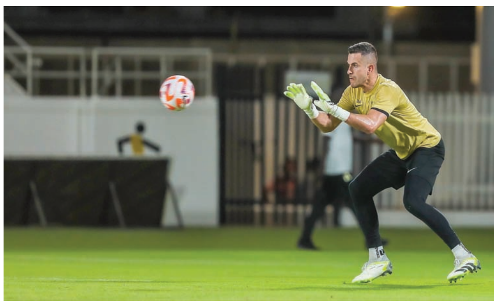
غروهي كان سداً متيناً الموسم الماضي لكنه قد يرحل (نادي الاتحاد)