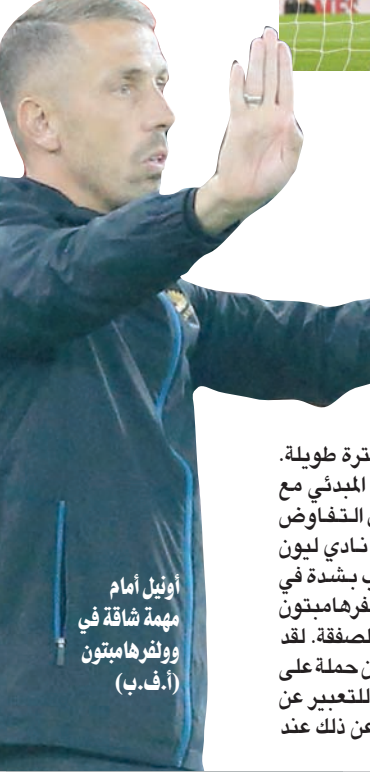
أونيل أمام مهمة شاقة في وولفرهامبتون