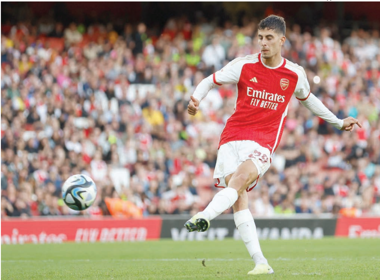
هافرتز يأمل بتقديم مستويات مميزة مع الوصيف

في أول ظهور للفريق في الدوري الإنجليزي الممتاز (بريميرليغ) في تاريخه، وفي عودته للدرجة الأعلى للمرة الأولى منذ أكثر من ثلاثة عقود، يسعى الفريق ذو الملعب الأصغر بين كبار الكرة الإنجليزية (بسعة 10 آلاف متفرج فقط) لكتابة تاريخ جديد للفريق. ومن أجل المشاركة في «بريميرليغ»، أبرم الفريق 11 صفقة لعل أبرزها ضم مدافع ولفرهامبتون ريان غيلس، مقابل 5 ملايين يورو، وظهير بيرمنغهام سيتي الهولندي تاهيت تشونغ مقابل 4 ملايين يورو.