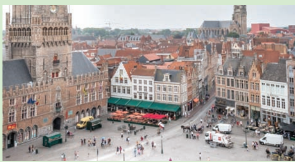
خشية من أن تلقى المدينة مصير البندقية