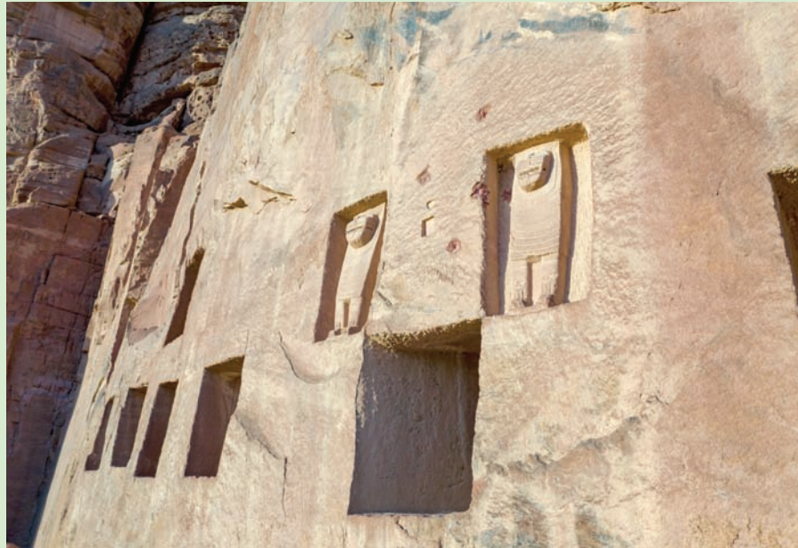
ستطلق خلال القمة جائزة «معهد الممالك» للآثار (الهيئة الملكية للعلا)