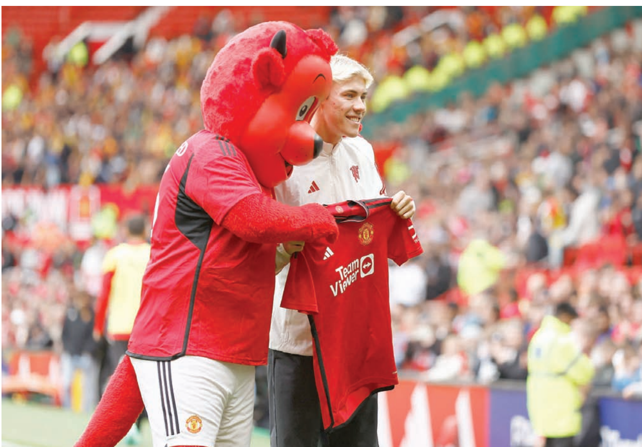
راسموس هولاند وطموحات كبيرة برفقة مان يونايتد (الشرق الأوسط)