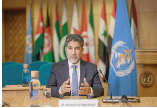
أحمد المنظري المدير الإقليمي لمنظمة الصحة العالمية لشرق المتوسط (الشرق الأوسط)