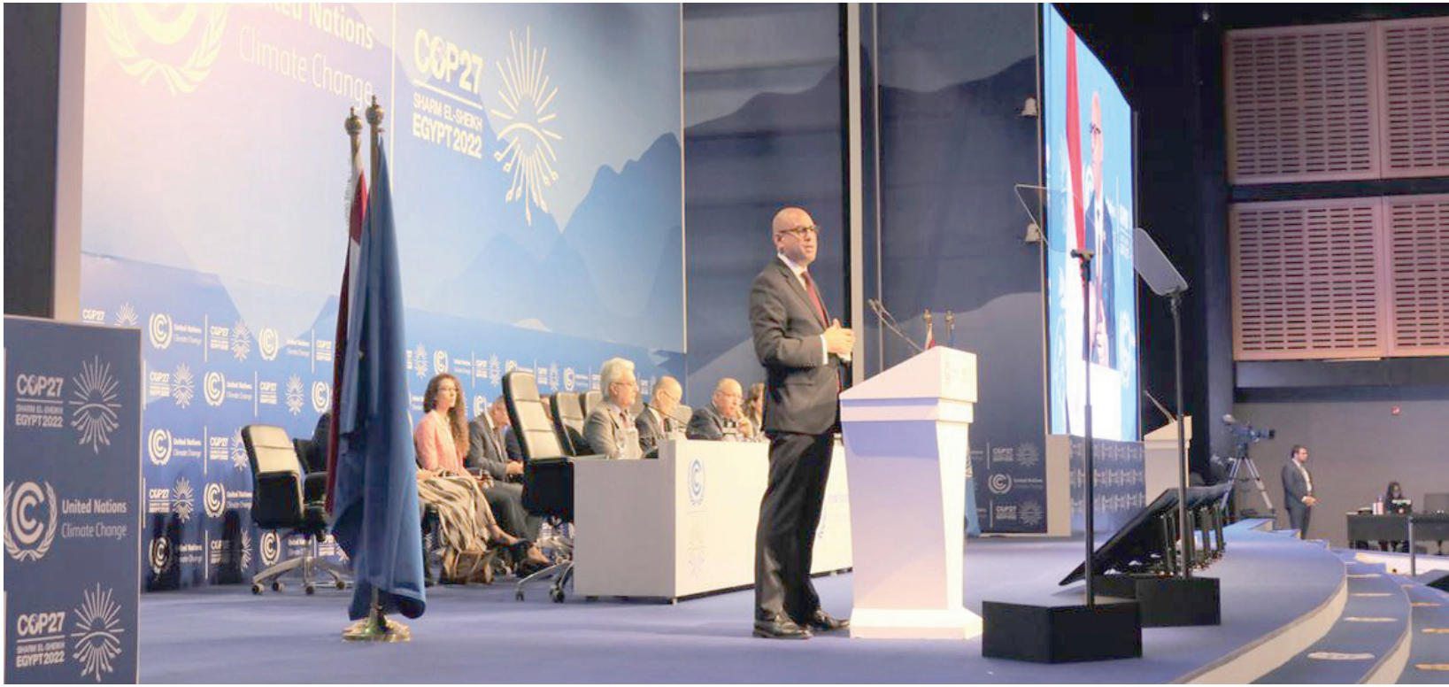
افتتاح مؤتمر الأمم المتحدة المعني بتغير المناخ في شرم الشيخ نوفمبر 2022 (موقع)

وأفادت قناة التلفزيون الرسمي الإسرائيلي، (كان 11)، بأن كاتس سيلتقي وزير التكنولوجيا والصناعة الإماراتي، سلطان آل جابر، وثلاثة وزراء أردنيين، هم: وزير المياه والري محمد النجار، والطاقة صالح الخرابشة، والبيئة معاوية الرايدة. ومن المقرر مشاركة مبعوث الولايات المتحدة الخاص لشؤون المناخ، جون كيري أيضاً في اللقاء. المشروع المذكور يشمل إقامة