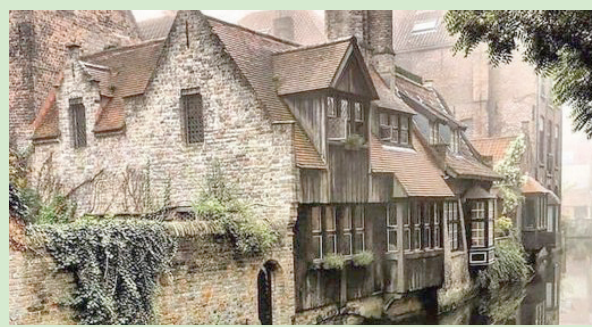
عظمة الطبيعة التي يرفع سكانها نداء الحد من السياحة المفرطة (فيسبوك)