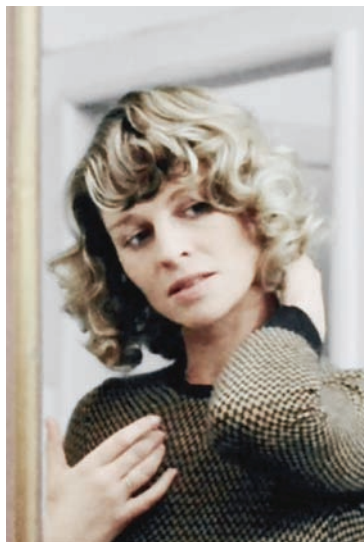
جولي كرستي في «لا تنظر الآن» (كاسي بروذكشنز)

إليوت غولد كان تحرياً خاصاً يحقق في حادثين معا تيدوان منفصلتين في اقتباس حر من أعمال الكاتب البوليسي رايموند تشاندلر. في الوقت ذاته كان آل باتشينو يؤدي دور التحري الحقيقي فرانك سربيكو في فيلم سيدني لومت Serpico. كان «سربيكو» أحد فيلمين ظهرا لباتشينو في ذلك العام. الآخر كان «فزاعة» (Scarecrow) للمخرج الجيد الثاني بنفسه عن العالم جيري تشاتزبيرغ (عمره الآن 96 سنة). «فزاعة» كان دراما اجتماعية عن لقاء بين رجلين، شاب (باتشينو) وآخر أكبر سناً وأكثر خبرة (جين هاكمن). كلاهما بعيد في عالمه عن الآخر لكن الصداقة تربطهما حتى عندما يدخلان إصلاحية. في محيطهما الاجتماعي فراغ كبير لم يعرفا كيف يملأه. روبرت رفورد وكلينت إيستود كانا أكبر نجمين آنذاك. والمفارقة أنهم لم يلتقيا لا في السياسة ولا في السينما.