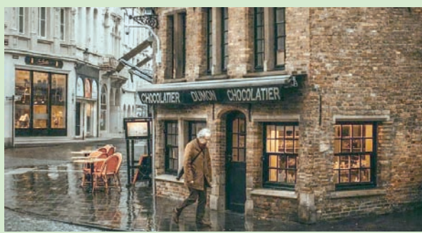
جانب من معالم مدينة بروج السياحية