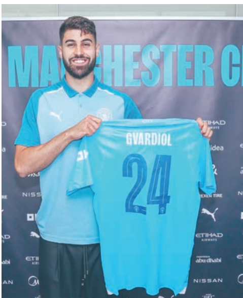
غفاردول ورحلة حافلة منتظرة مع البطل