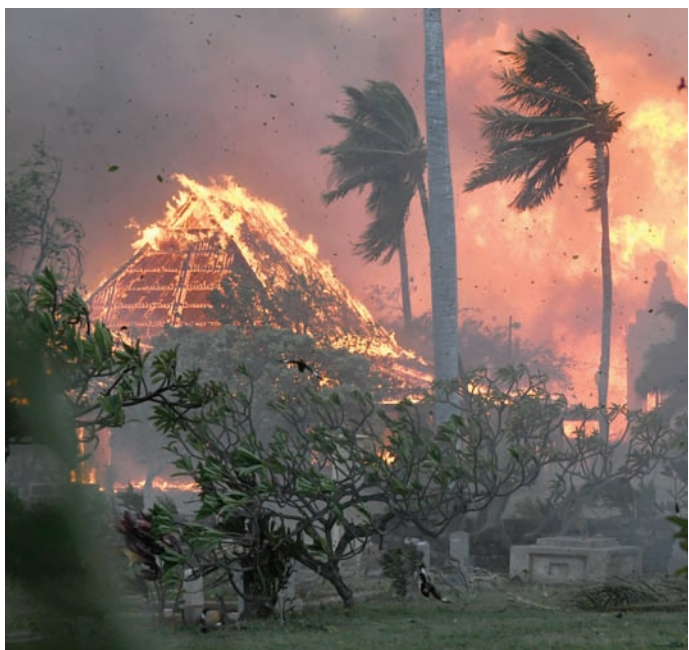
النيران مستعرة في بلدة لاهاينا التاريخية الثلاثاء الماضي

إن الجزيرة الكبيرة تشهد حرائق في الوقت الحالي، برغم عدم ورود تقارير عن وقوع إصابات أو تدمير منازل هناك».