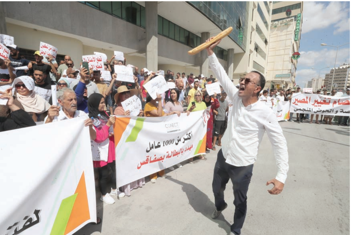
مظاهرة نظمها بعض سكان العاصمة أمام وزارة التجارة للاحتجاج على نقص الدقيق والخبز

وفي وقت سابق، أعلنت وزارة الفلاحة أن محصول البلاد من القمح تراجع هذا العام 60 في المائة إلى 250 ألف طن بسبب الجفاف، وهو ما من شأن أن يزيد من الصعوبات المالية التي تواجهها البلاد، في الوقت الذي تحاول فيه الحصول على حزمة إنقاذ دولية.