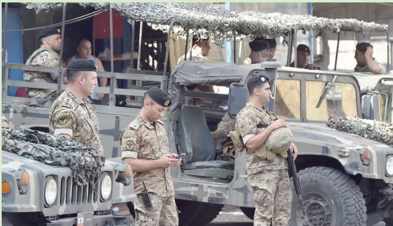
انتشار عناصر من الجيش اللبناني في موقع حادثه الشاحنة بحالة أمس