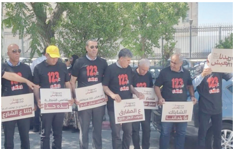
رؤساء بلديات عرب يحتجون على الجريمة المنظمة (لجنة المتابعة)

وعقد سموتريتش مؤتمراً صحافياً أعلن فيه عن تشكيل لجنة خاصة لملاحقة هذه العصابات. وعلق محاميد، بأن «قيادات المجتمع العربي تبارك كل خطوة لمكافحة الجريمة، مالياً أو قانونياً. لكنها ترفض أن تستخدم هذه ذريعة لتكريس الأمر الأساسي، وهو سياسة