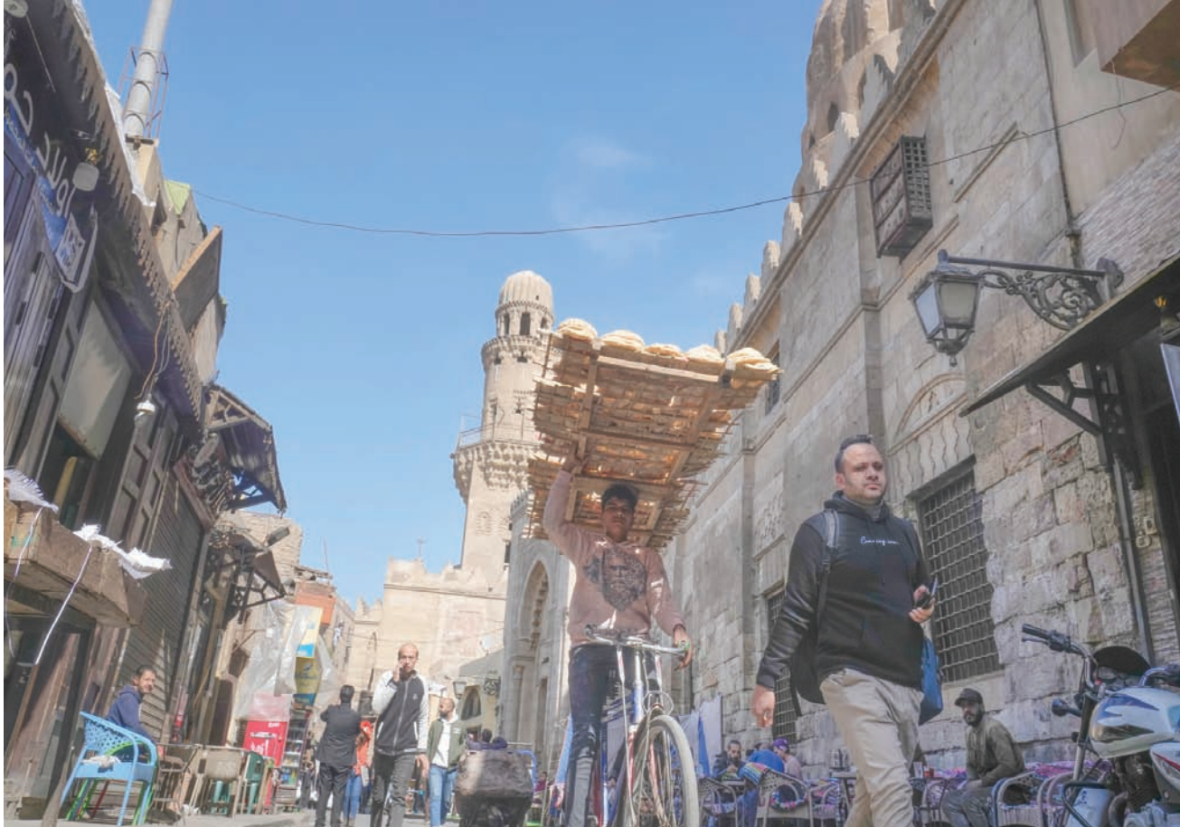
بانغ خبز في أحد شوارع العاصمة المصرية القاهرة... فيما أظهرت البيانات ارتفاع التضخم إلى أعلى مستوياته على الإطلاق في يوليو الماضي

حزم التمويل للبلاد، خاصة إذا كانت مراجعات صندوق النقد «إيجابية» كما هو مرجح.