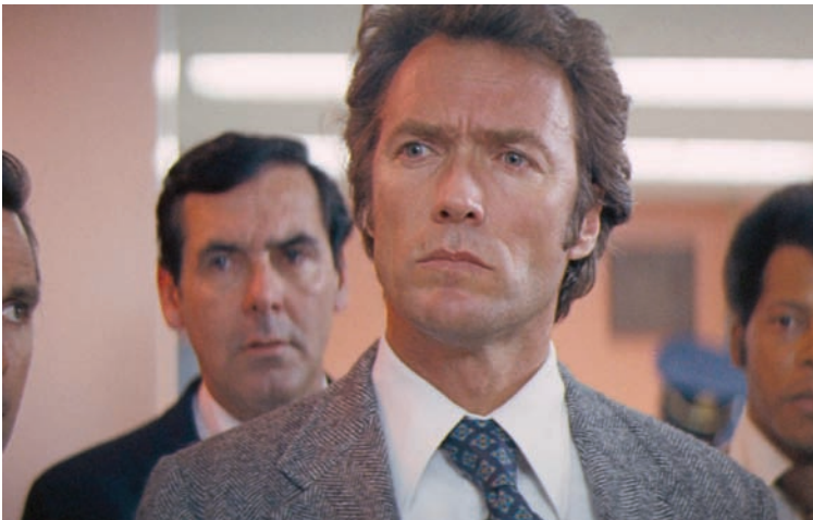
كلينت إيستود في «ماغنوم فورس» (وورنر)

ضعيف * وسط ** جيد *** جيد جداً **** ممتاز *****