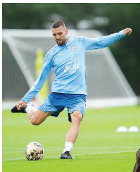
كافاستيش... خبرة وتمزس وورقة مميزة في مان سيتي

المركزي الثاني عشر في سلم الترتيب، ولفرهامبتون مقابل 6 ملايين يورو، وذلك تحسباً لرحيل هدافه الصربي ألكسندر ميتروفيتش المطلوب بشدة في الهلال السعودي.