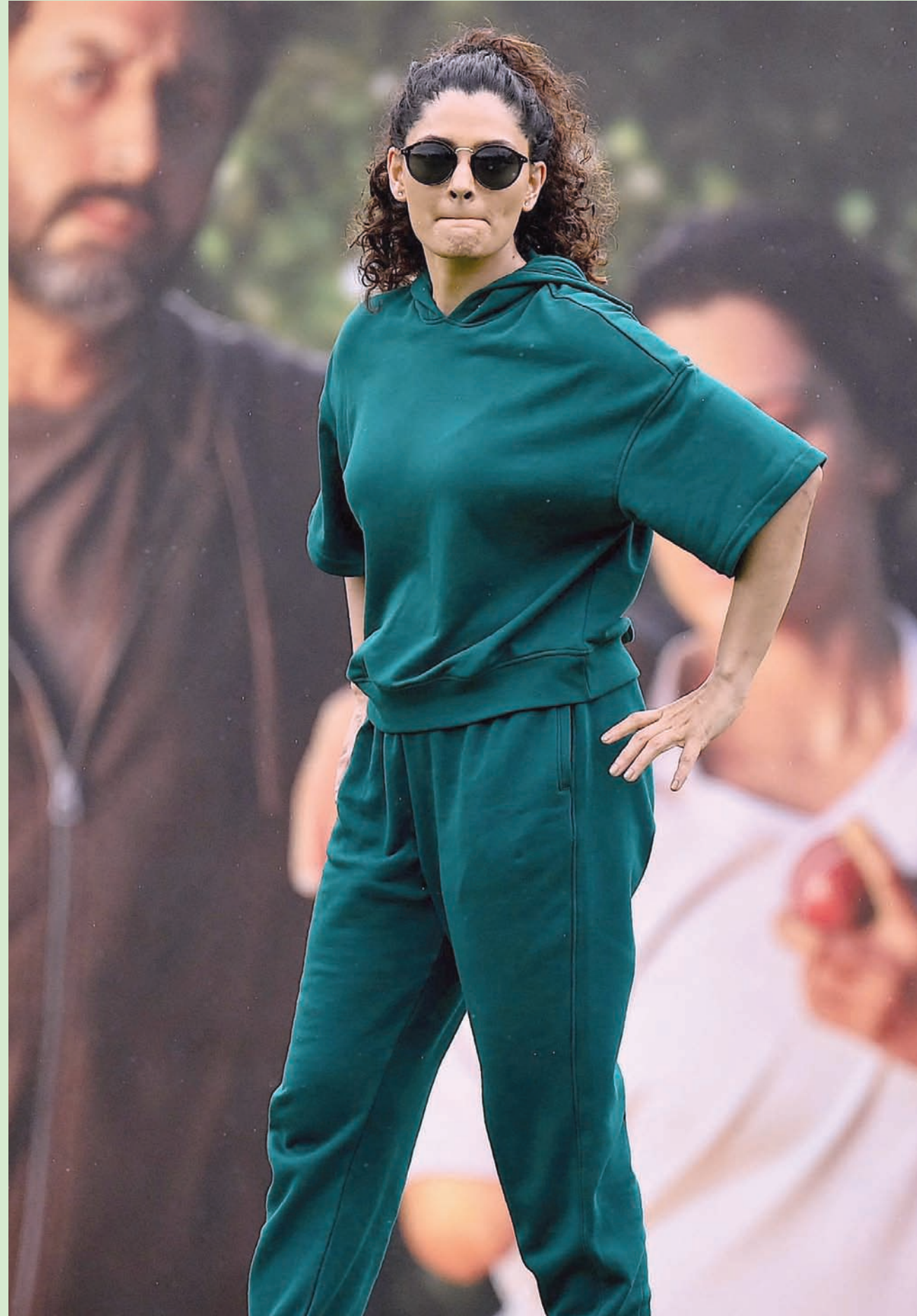
ممثلة بوليوود سايامي خير تشارك في لعبة الكريكيت خلال الترويج لفيلمها المقبل «غومر» في ممباي (أ.ف.ب)

سأل حبر كثير وحُزرت الوف مؤلفة من الصفحات عبر التاريخ الحديث حول هذه القضايا، وبعضها عمل عظيم وكشف جديد، فما صبر كل هذا؟! بالتوفيق لكل الساعين لخير الناس من أجل كل الناس.