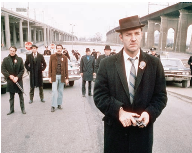
جين هاكمن في «الرابط الفرنسي»

ما بين «طارد الأرواح الشريرة» وفيلم فرايدكن المرعب الآخر هذا «حشرة» العديد من الأفلام التي حققها فرايدكن بلا قيمة فنية (وأحياناً تجارية)