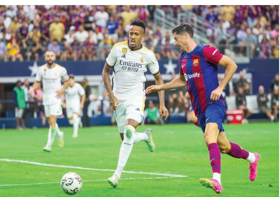
برشلونة استعاد بعض قدراته الهجومية بعد ضم ليفاندوفسكي

وفي المقابل، رحل المهاجم الفرنسي كريم بنزيمة عن صفوف الريال هذا الصيف إلى الدوري السعودي بعد سنوات طويلة من السطوع في صفوف الريال، ولكن النادي الملكي تعاقد مع لاعب خط الوسط الإنجليزي جود بيلينغهام، الذي يعد أحد أبرز النجوم الواعدة في ملاعب الساحرة المستديرة حالياً. كما يملك الفرق مجموعة متميزة من اللاعبين، الذين اكتسبوا خبرة كبيرة في المواسم الأخيرة، مثل جافي وبيدي وأنسو فاتي وفرنكي دي