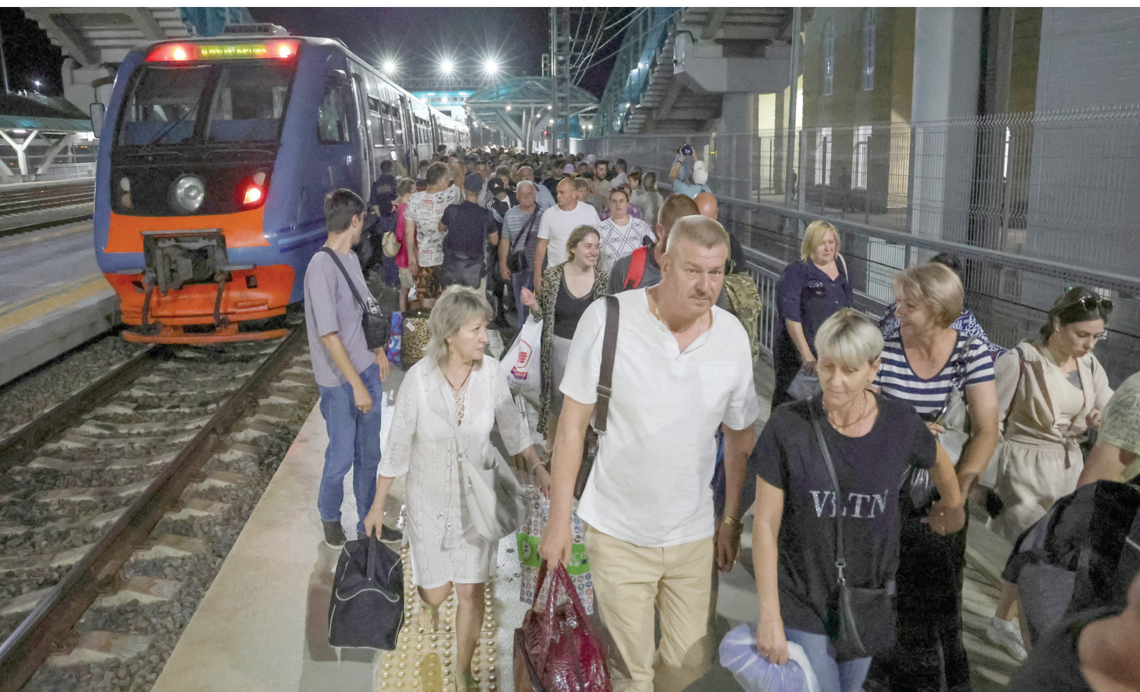
قطارات على جسر كيرتش الذي يربط القرم بالبر الروسي

ما تم استبداله كحاكم لسيفاستوبول وحل محله بيروقراطي روسي هو، سيرجي مينيايلو، وترك السياسة. وموقف النخبة في دونباس مختلف للغاية. فعلى الرغم من الوضع المزيف كدولتين «جمهورية دونيتسك ولوهانسك الشعبيتين» المعلنين ذاتياً، اللتين ظهرتا إلى حيز الوجود بعد انتفاضة برعاية روسيا في عام 2014، أبقمت موسكو النخب المحلية على مسافة. وكانت معظم الاتصالات عبر المغامرين الذين تمكنوا من تأمين تفويضات لأنفسهم بصفتهم «أمناً دونباس» في الكرملين. وسعيًا لتحقيق أقصى قدر من السيطرة، رفع الكرملين من شأن شخصيات سياسية هامشية في دونباس. ومنذ عام 2014، ظهر مديرو الأزمات الروس بوتيرة متزايدة، ولم تؤد بداية الغزو الشامل إلا إلى تسريع هذه العملية. ولطالما كان الامتثال المؤيد للكرملين أفضل وسيلة للنخب المحلية للبقاء على قيد الحياة. وفي كل من دونيتسك ولوهانسك، لا توجد أوامير بان أي زلّة قد تدفع الكرملين إلى تنفيذ تناوب واسع النطاق للنخب المحلية من شأنه أن ينهي الوضع الخاص لدونباس. لذلك يحاولون إبقاء رؤوسهم منخفضة، وهم حريصون دائماً على تنفيذ رغبات بوتين.