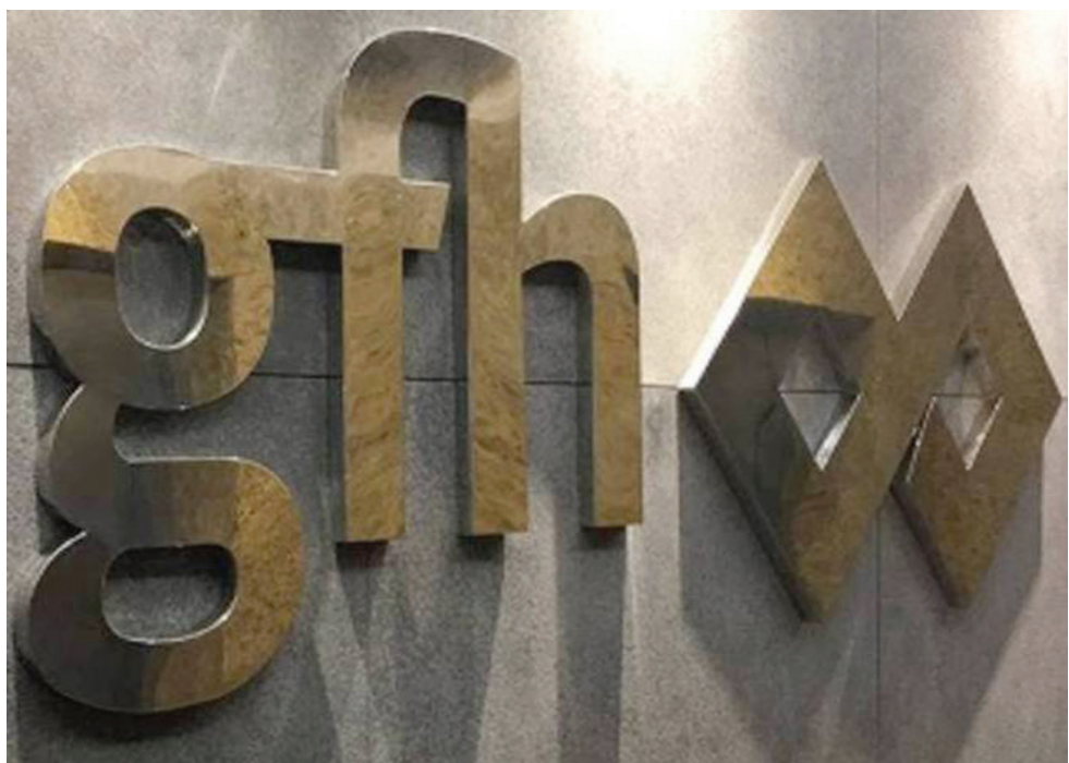
«جي إف إتش» المالية (الشرق الأوسط)

أعلنت مجموعة «جي إف إتش» المالية تسجيل ربح صافي يؤول إلى المساهمين بقيمة 30,61 مليون دولار للربع الثاني من العام بزيادة 32,74 في المائة مقارنة بـ23,06 مليون دولار للربع الثاني من عام 2022، مشيراً إلى أن النتائج المالية تعكس استمرار النمو والتقدم المحطد. وقالت المجموعة المالية التي تتخذ من العاصمة البحرينية المنامة مقراً لها، إن المساهمات الرئيسية للدخل الناتج عن توظيف استثمارات المجموعة على المستويين العالمي والإقليمي شملت الأعمال المصرفية التجارية وأنشطة الخزائنة، حيث بلغت ربحية السهم للربع الثاني 0,86 سنت مقابل 0,66 سنت للربع الثاني من عام 2022.