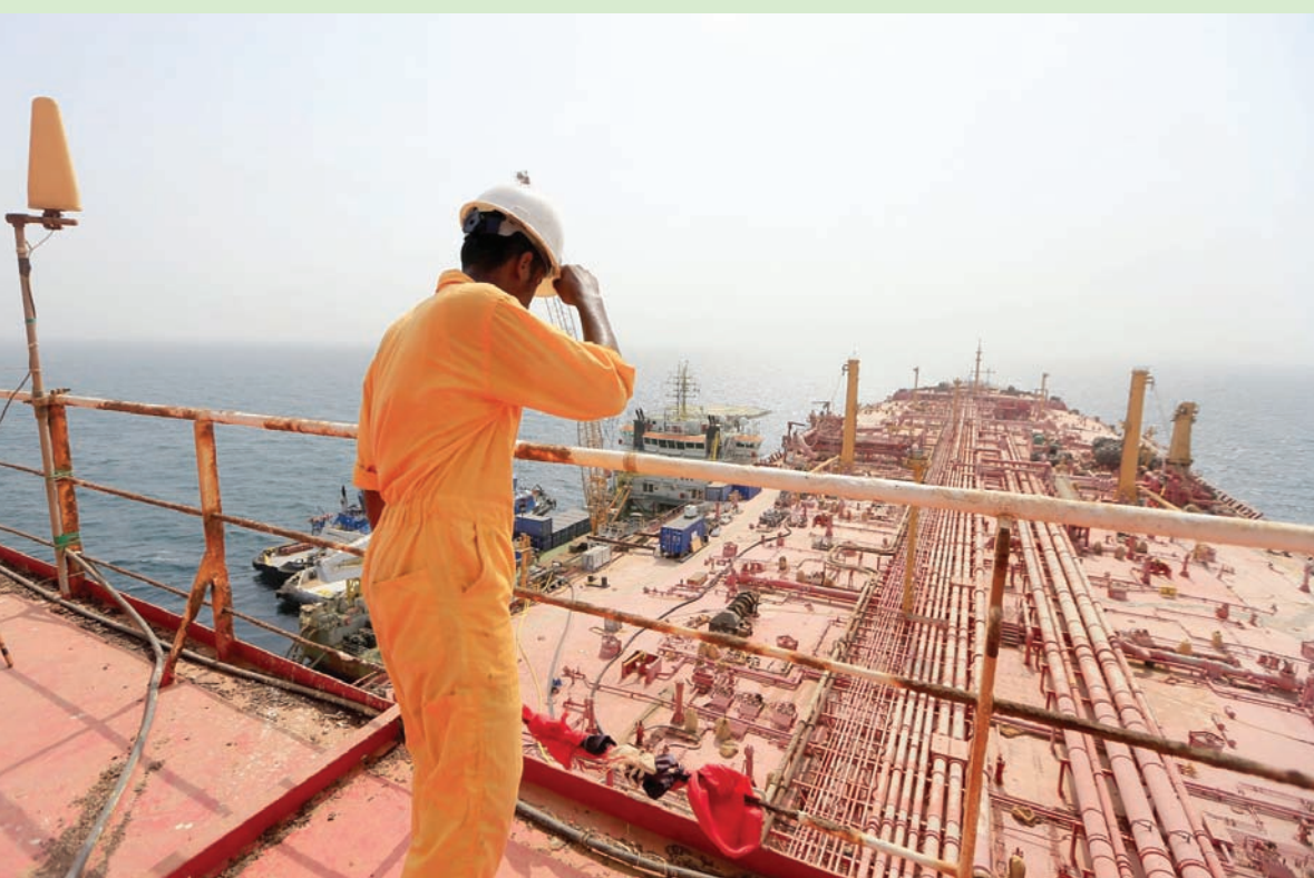
تساور الشكوك خبراء البيئة حول انتهاء خطر خزان النفط اليمني «صافر»

وسط استغراب الوزير من السلوك الأممي، أشار إلى الجهود التي بذلتها الحكومة الشرعية رغم شح الإمكانيات عبر البرنامج الوطني للتعامل مع الألغام والفرق الهندسية العسكرية التابعة لوزارة الدفاع، والمشروع السعودي «مسام» لتطهير الأراضي اليمنية من الألغام، والتوعية بخطورها، وتقديم المساعدة لضحايا من خلال إجراء الجراحة التجميلية وتركيب الأطراف الصناعية وتوفير خدمات إعادة التأهيل.