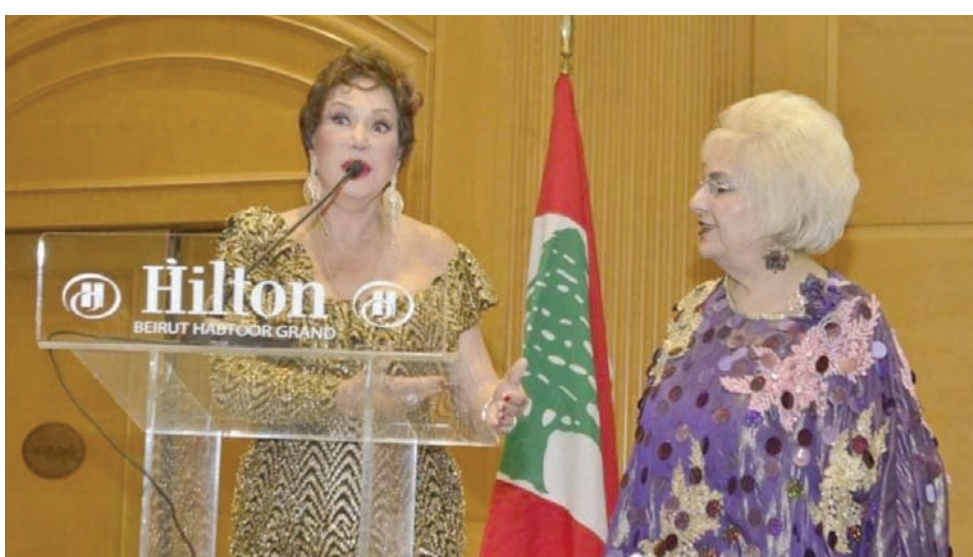
لبلة تلقي كلمة خلال تكريمها