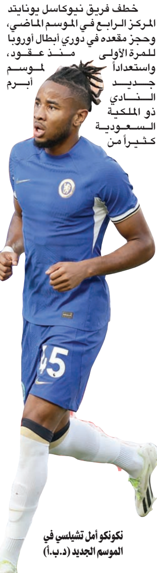
توتكوو أمل تشيلسي في الموسم الجديد

خطف فريق نيوكاسل يونايتد المركز الرابع في الموسم الماضي، وحجز مقعده في دوري أبطال أوروبا للمرة الأولى منذ عقود، واستعداداً للموسم الجديد النادي ذو الملكية السعودية كثيراً من استعداداً للموسم الجديد.