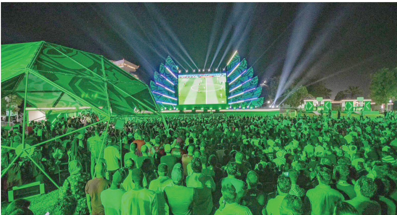
جمهور يتابع إحدى مباريات المنتخب السعودي في كأس العالم 2022 التي أقيمت في قطر

ووقع صندوق الاستثمارات العامة في مطلع فبراير (شباط) الماضي، اتفاقية مع «إيروفارمز» الأميركية، بغرض تأسيس شركة مقرها في مدينة الرياض (وسط المملكة) تهدف إلى إنشاء مزارع عمودية داخلية في البلاد ومنطقة الشرق الأوسط وشمال أفريقيا. وتوسع الاتفاقية للمساهمة في الاستخدام الأمثل للموارد الطبيعية والأراضي الزراعية، من خلال تبني تقنيات الزراعة العمودية الداخلية، التي لا تتطلب استخدام الأراضي الصالحة للزراعة، وتستهلك كميات أقل من المياه بنسبة 95 في المائة مقارنة بطرق الزراعة التقليدية، وبما يضمن وفرة الإنتاج في المحاصيل الزراعية. ومن المتوقع أن تساهم الشركة في توفير محاصيل