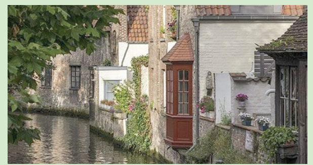
مشهد من جمال مدينة بروج