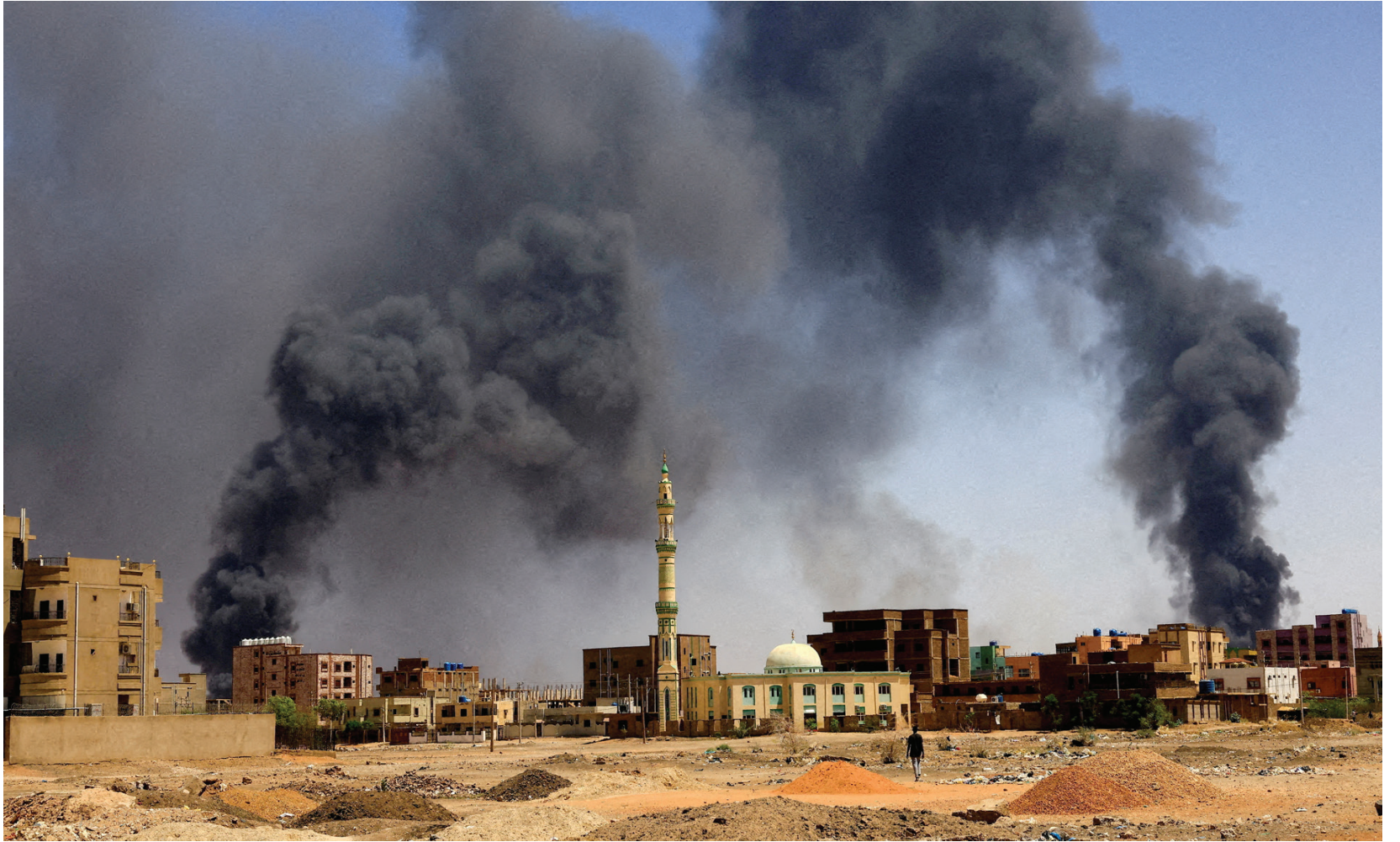
الدخان يتصاعد فوق المباني بعد قصف جوي خلال اشتباكات بين قوات «الدعم السريع» والجيش السوداني في الخرطوم