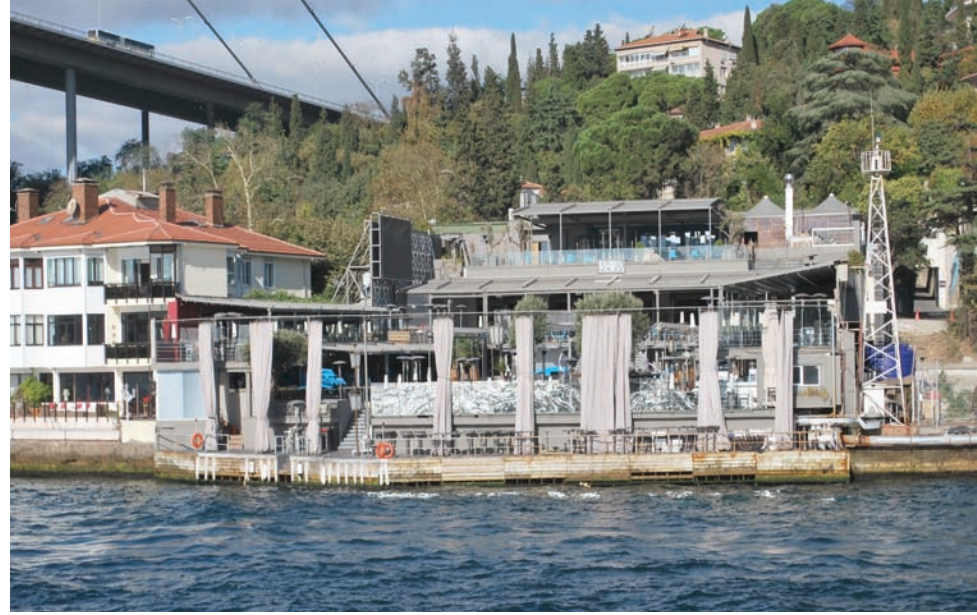
نادي رينا الليلي في إسطنبول تم هدمه بعد الهجوم الإرهابي الذي شهد ليلة رأس السنة عام 2017

كشفت تقرير أمني عن أن تركيا باتت تمتلك قاعدة بيانات «قيمة» تحوي أسماء ومعلومات كاملة عما يقرب من 10 آلاف «ذئب منفر» يعملون لصالح تنظيم «داعش» الإرهابي بحثت عنها أجهزة مخابرات غربية وقادت مفاوضات مجموعة تعمل لصالح المخابرات الإيرانية للحصول عليها مقابل أكثر من 9 ملايين دولار.