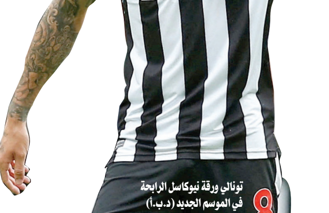
توني وورقة نيوكاسل الراجعة في الموسم الجديد

الصفقات لدعم صفوفه. لاعب وسط ميلان الإيطالي ساندر تونالي كان الصفقة الأعلى لـ«ماغايرز» حتى الآن، حيث تكلفت 64 مليون يورو، في الوقت الذي ضم فيه جناح ليستر سيتي، هارفي بارنز مقابل 44 مليون يورو، وظهير ساوتهامبتون، تينو ليفرامنتو، مقابل 37 مليون يورو. ولعل أبرز الراحلين عن الصفقات لتدعيم صفوفها استعداً للدوري «الأعلى» في العالم، حيث أنقذت الأندية الـ20 ما يتجاوز المليار يورو لضم اللاعبين في نافذة الانتقالات الصيفية الحالية، والرقم مرشح للارتفاع مع تبقي ثلاثة أسابيع على إغلاق باب الانتقالات لهذا الصيف.