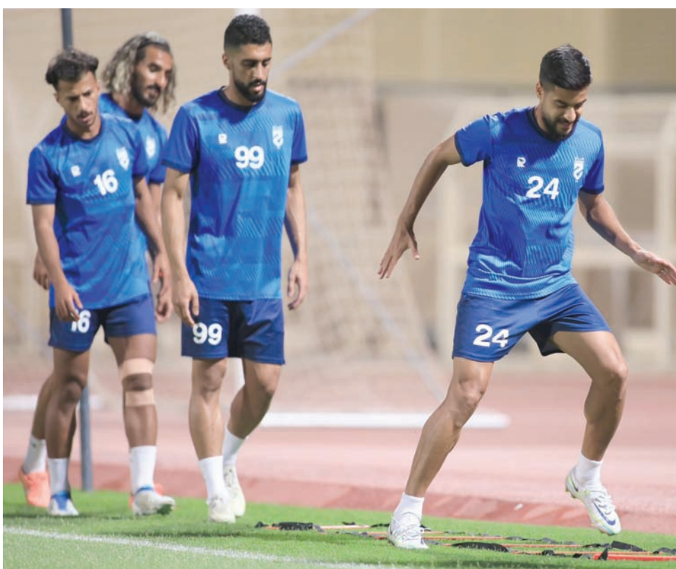
فريق الحزم يأمل تدشين مشواره في الدوري السعودي بأفضل صورة ممكنة

سيكون الرقم 18 علامة فارقة على صعيد عدد الفرق المشاركة في النسخة الجديدة للدوري السعودي للمحترفين وهو الرقم الأعلى في تاريخ منافسات الدوري السعودي عبر تاريخه، إلا أنه رقم غير مستغرب في مسابقات الكرة السعودية، حيث يُقام دوري الدرجة الأولى بمشاركة ذات الرقم 18، وسبق له أن أقيم بمشاركة عشرين فريقاً وهو الاتجاه القادم لمنافسات دوري المحترفين في السنوات القادمة الذي