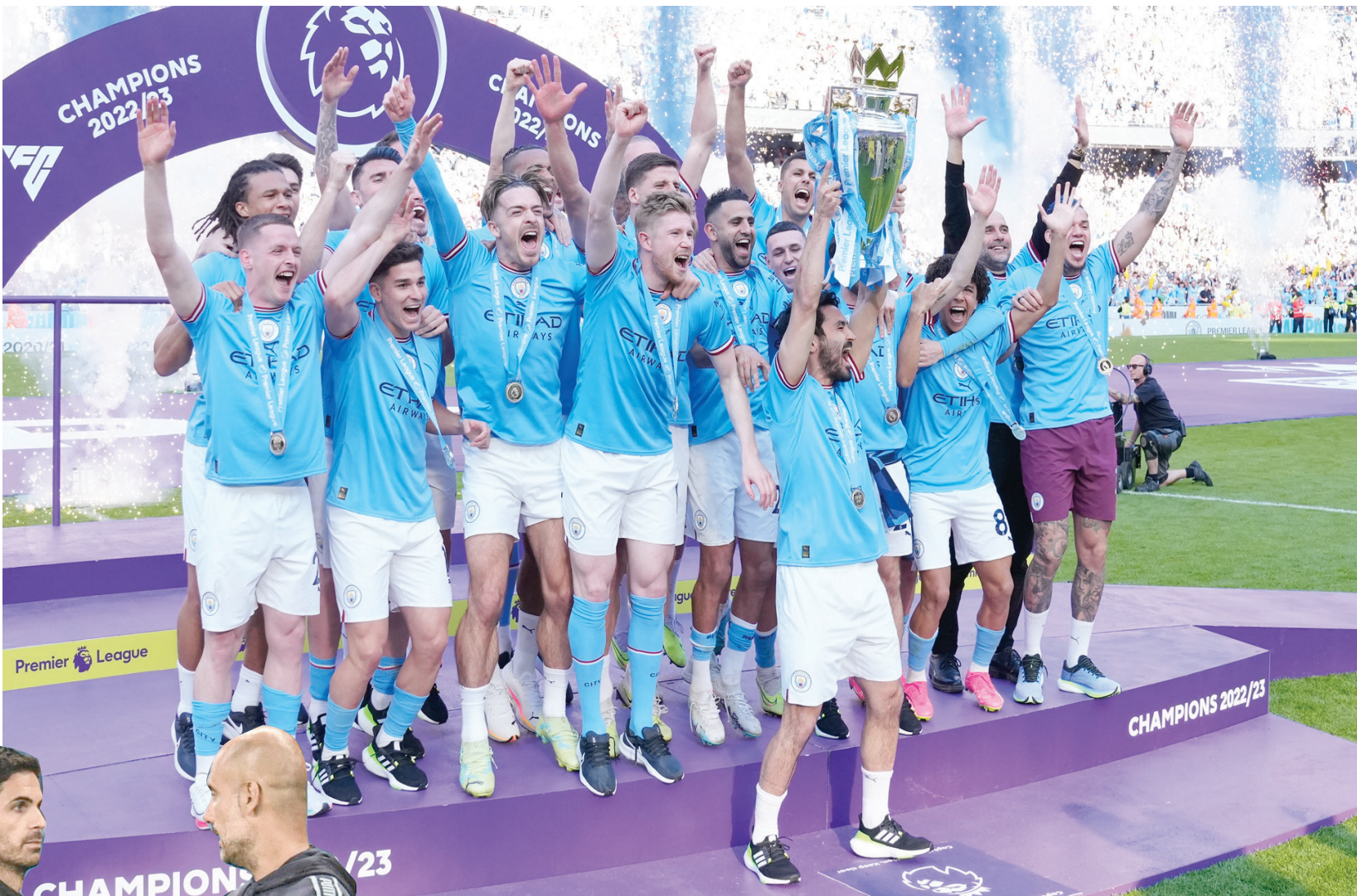
حلم سيتي بأن يصبح أول فريق يفوز بلقب الدوري الإنجليزي لأربع مرات متتالية يصدم بالطامحين إلى إسقاطه عن العرش

توقعات بأن تتكرر المنافسة على اللقب بين غوارديولا وأريوليتا