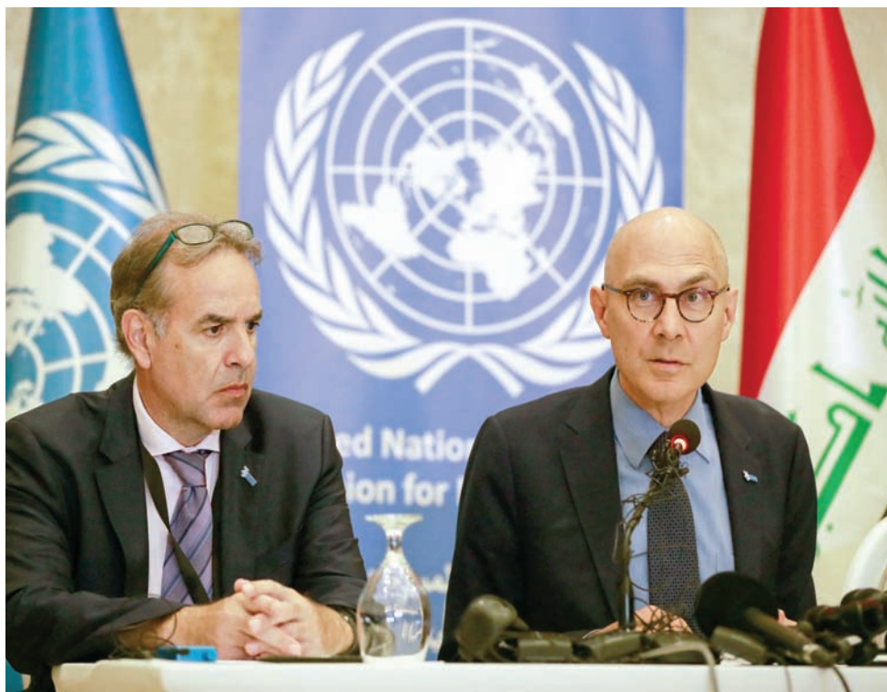
المفوض السامي لحقوق الإنسان في الأمم المتحدة فولكر تورك

وقال السوداني خلال افتتاحه وحدتين مركبتين في محطة كهرباء العمارة الغازية بمحافظة ميسان في الجنوب، إن «هذا المشروع سيرفد المنظومة بطاقة جديدة تبلغ 250 ميغاواط»، مبيناً في الوقت نفسه أن «هذه المشاريع الاستراتيجية ستسهم في تقليل إنفاق الموازنة التشغيلية، خاصة ما يتعلق باستيراد الغاز، وهي من المشاريع المستمرة منذ عام 2019، وتأتي ضمن توجه الحكومة لإكمال المشاريع المتوقفة والمملكتة». كما أشار السوداني إلى أن «توجه الحكومة ووزارة الكهرباء، خلال المرحلة الماضية، ركز على تنفيذ مشاريع الدورة المركبة، وقد تم توقيع المرحلة الأولى لإنتاج ما يقارب 1140 ميغاواط من الطاقة الكهربائية، ومن المزمع توقيع المرحلة الثانية من مشاريع الدورة المركبة، حتى يصل إجمالي الطاقة إلى 4 آلاف ميغاواط ستغذي دون الحاجة إلى وقود إضافي». ومضى السوداني قائل إن «الحكومة مستمرة على أكثر من صعيد لتحسين واقع منظومة الكهرباء»، مؤكداً أن «كل المشاكل والأزمات التي تعرضت لها منظومة الكهرباء هي خارج إرادة الوزارة، بسبب إشكالية استيراد الغاز، الذي عاجلته الحكومة عبر قرارات اتخذت لأول مرة، حيث تم حسم موضوع تسديد المستحقات من خلال المفاضلة بالنفط الخام والأسود