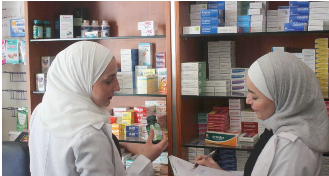
إحدى صيدليات دمشق (أرشيفية)

وكانت مديرية الشؤون الصيدلانية في وزارة الصحة السورية قد أعلنت يوم الثلاثاء، إصدار نشرة جديدة لأسعار الأدوية عدلت بموجبها أسعار آلاف الأصناف الدوائية بنسب تجاوزت 50 في المائة في بعض الأدوية، وذلك بعد تعديل سعر الصرف بنسبة 50 في المائة.