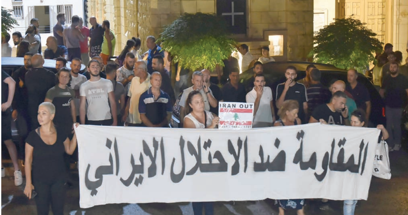
من الشعارات التي رفعها أبناء المنطقة ضد سلاح «حزب الله»

وتجمّع عدد من أهالي بلدة الكحالة والقرى المجاورة قرب مكان انقلاب الشاحنة وقطعوا الطريق ومنعوا الجيش من إخراج الحمولة