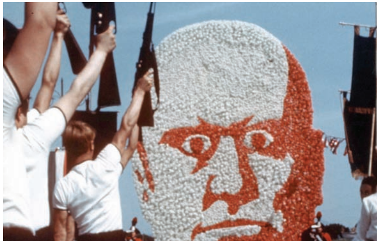
فيلبيني وموسيليني في «أماركورد»