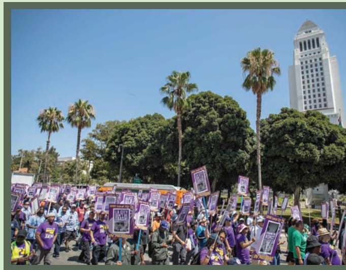
إضراب هوليوود يشلّ قطاع الإنتاج

الإيجابية لهذا التدفق الكبير لهم على صعيد الاقتصاد والتوظيف، فإنهم ينددون بما يعذونه سياحة غير متوازنة تحول مدنهم إلى متحف في الهواء الطلق. وعلى عكس المدن السياحية الأوروبية.