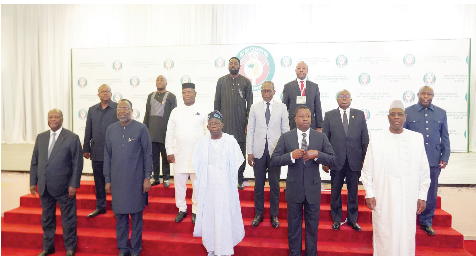
صورة مشتركة لقادة دول «إيكواس» قبل اجتماعهم في أبوجا أمس

التطور الرئيسي الثاني عنوانه عودة التواصل بين المجلس العسكري والرئاسة النيجيرية بعد أن رفض العسكر أول من أمس استقبال وفد من الأمم المتحدة والاتحاد الأفريقي «إيكواس»، بحجة العجز عن توفير الأمن اللازم للبعثة المختلطة.