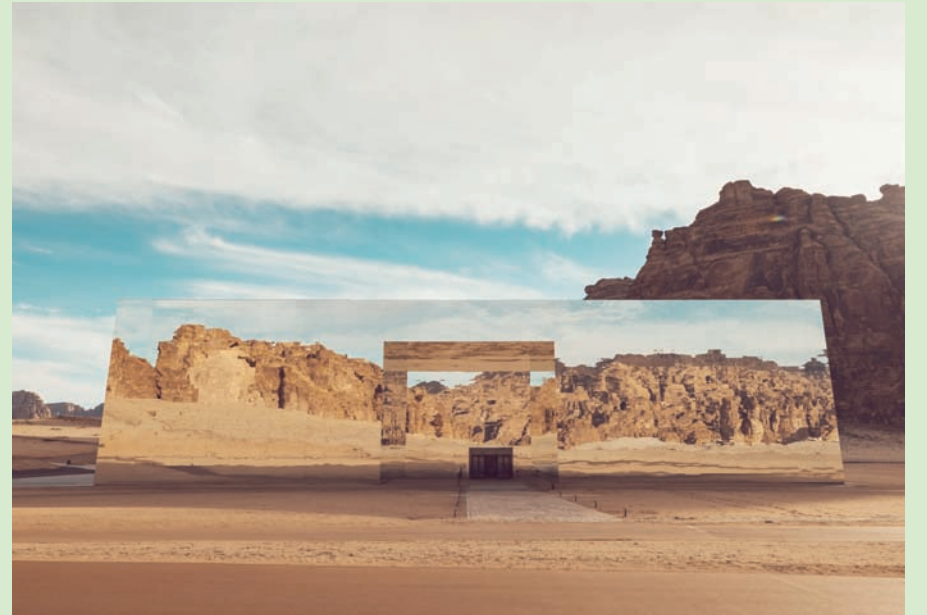
توفر القمة منصة عالمية للنقاش العلمي والابتكار (الهيئة الملكية للعلا)

الجذب التاريخي والجغرافي والتراثي، وتنظيم المؤتمرات ذات الصلة التي تؤكد حضور العلا ضمن خريطة أهم المواقع التاريخية في العالم، وكذلك تفعيل الشراكات مع المنظمات الدولية، إذ تُعدّ أحد أهم الأماكن الأثرية في العالم التي تحكي معالمها تاريخ حضارات إنسانية، وتمتاز بجمال طبيعي وتراث إنساني نوعي، وتوفّر وجهة فريدة لتجربة سياحية عالمية مميزة.