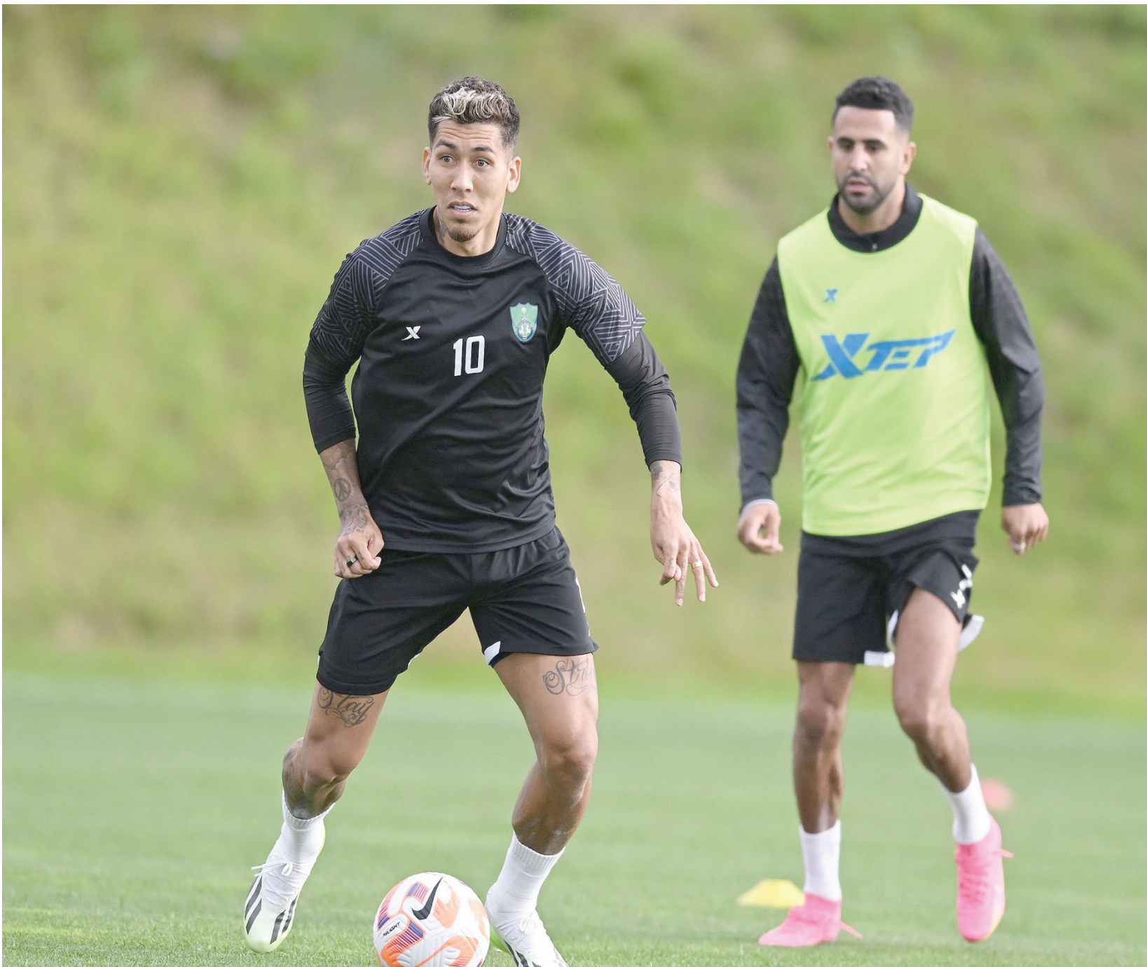
الأضواء مسلطة على محرز وفيرمينيو في أول ظهور بالملاعب السعودية (النادي الأهلي)

ويدشن الاتحاد مشواره في النسخة الجديدة من الدوري بمواجهة نظيره الرائد على ملعب مدينة الملك عبد الله الرياضية ببريدة في مواجهة يسعي معها لتسجيل بداية مثالية بعد