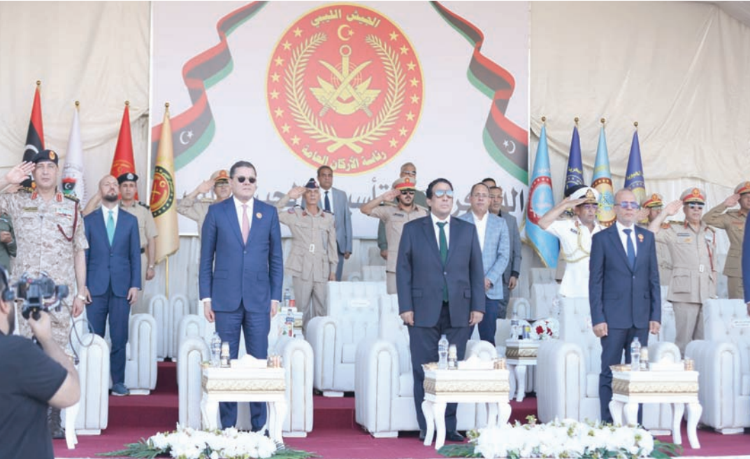
جانب من احتفالات السلطة التنفيذية في طرابلس بذكرى تأسيس الجيش الليبي (المجلس الرئاسي)

الموجودة أمامي هي العناصر التي نعمل عليها في كل كبيرة وصغيرة، وهم الحصن للجيش وللوطن بكامله».