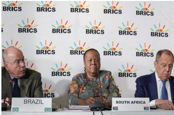
وزراء خارجية البرازيل ماورو فييرا (يسار) وجنوب أفريقيا نالدي باندور والروسي سيرغي لافروف خلال اجتماع سابق لوزراء خارجية «بريكس» في كيب تاون

أكثر بـ13 ضعفاً مما حصلت عليه أفريقيا، وطالب بالعمل على توفير قروض بوابد قليلة للدول الفقيرة والنامية». ويرى رامي زهدي، الخبير المصري في الشؤون الأفريقية، أن توجه بنك التنمية التابع لتجمع دول «بريكس» إلى التوسع في التعامل بالعملة المحلية يمكن أن يمثل «طوق نجاة» لكثير من دول القارة التي تعاني ارتفاعاً في ضغوط الديون والتضخم نتيجة ارتفاع معدلات الفائدة على الدولار الأمريكي.