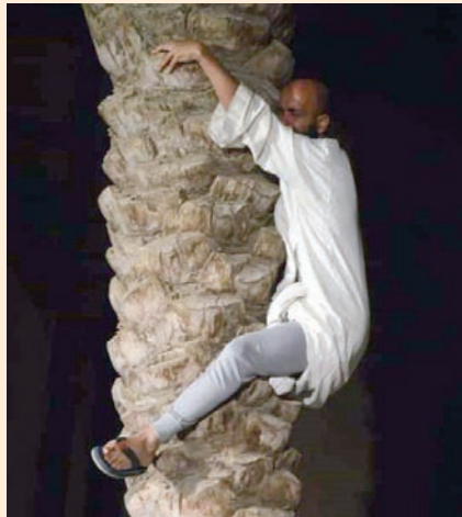
أماكن مفتوحة لعرض المسرحية (مخرج العرض)

طاقة أمل وشحنة من التمرد ضد كل فكرة انهزامية يخرج بها المتفرج بعد انتهاء هذا العرض المسرحي، فقد تأكد عبر العديد من القصص الاجتماعية أنه بالفعل يوجد ضوء في آخر النفق الاجتماعي المظلم، كما تبين عبر دراما مكثفة للغاية أنه من الأفضل أن نوقد شمعة أمل بدلاً من أن الاكتفاء بلعن ظلام اليأس.