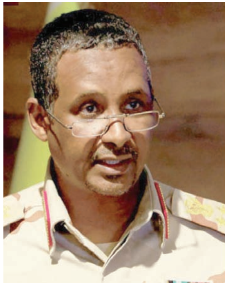
محمد أمين ياسين قائد قوات «الدعم السريع»

ووفقاً للمصادر تحدثت لـ«الشرق الأوسط» فقد دارت معارك ضارية بين الطرفين بعد محاولة من الجيش لفك الحصار المفروض على منطقته العسكرية من خلال قيامه بعمليات تمشيط مستخدماً «قوات العمل الخاص» ضد قوات الدعم السريع، التي كثفت خلال الفترة الماضية من انتشارها في الأحياء السكنية لإحكام الخناق على الجيش. وعلمت قوات الدعم السريع عن حصيلة المواجهات التي جرت، أمس، قائلة إنها دمرت 6 دبابات و4