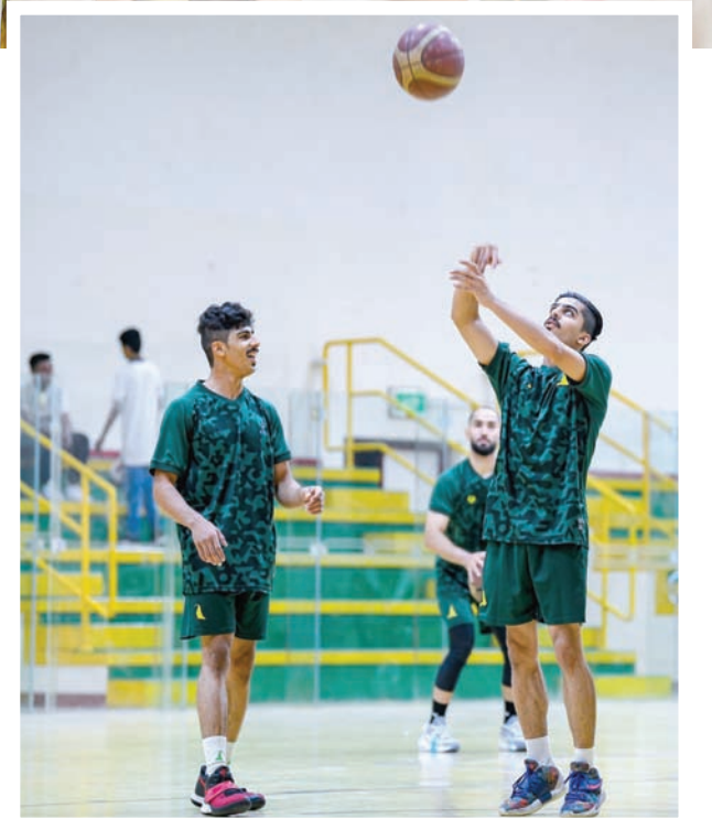
تطوير منشأة الخليج سيكون أثره إيجابياً على جميع ألعابه

قدم الهمل شكره لولي العهد الأمير محمد بن سلمان «الذي أولى الرياضة الشيء الكثير، حيث نعيش نهضة غير مسبوقه في المجالات كافة»