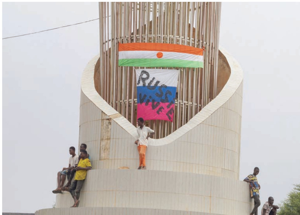
علماء النيجر وروسيا أمام مقر البرلمان في نيامي الخميس

تأزّل مبكّر ومع رحيل فرنسا كمستعمر مطلع الستينات، حاولت هذه الدول ممارسة استقلالها السياسي، وحاولت صناعة ذاتها، تارة عبر الاشتراكية كما حدث في مالي خلال عهد موديبو كيتا أول رئيس لها