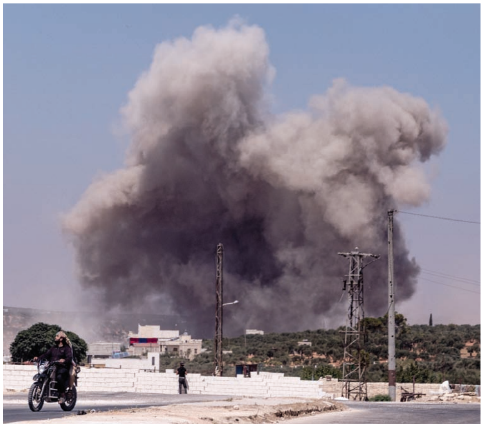
دخان يتصاعد بعد غارة روسية على ضواحي إدلب السبت

غير أن مناطق عدة لا تزال خارج سيطرة دمشق، بينها تلك الواقعة تحت سيطرة القوات التركية والفصائل الموالية لها في شمال البلاد، ونحو نصف محافظة إدلب الواقعة تحت سيطرة «هيئة تحرير الشام» (جبهة النصرة سابقاً)، إضافة