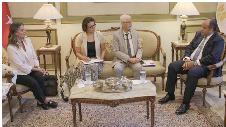
وزير الصناعة المصري أحمد سمير خلال لقائه مستثمرين أتراك في أنقرة

كان سمير قد قال، يوم الجمعة، إن مجموعة «كي أو سي» الاستثمارية التركية تعزز التوسع في السوق المصرية الفترة المقبلة بقطاعات السيارات والمستحضرات الطبية والطاقة الجديدة. وقال بيان صادر عن وزارة التجارة والصناعة، إن سمير الذي يزور تركيا حالياً التقى ممثلين للمجموعة لبحث رؤيتها المستقبلية لزيادة الاستثمارات في السوق المصرية.