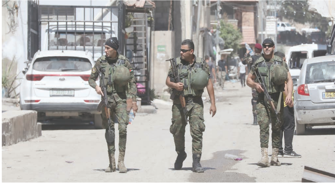
عناصر من الأمن الفلسطيني خلال زيارة الرئيس محمود عباس إلى مخيم جنين في 12 يوليو الماضي (أ.ب.أ)

وخلال عام ونصف عام، قامت 13 كتبية فقط بالهجمات الأمنية الحالية في الضفة، ومنذ أن بدأت موجة الهجمات تتضاعف زاد عدد الكتيبات بنحو 25. ولا يزال هذا العدد عند قرابة ربع الكتيبات التي عملت في الضفة في ذروة الانتفاضة الثانية قبل نحو 20 عاماً، ويمكن أن تعود هذه الفجوة في عدد الجنود الميدان في جزء كبير منها إلى التقنيات المتقدمة والذكاء الاصطناعي، وهو ما لم يكن