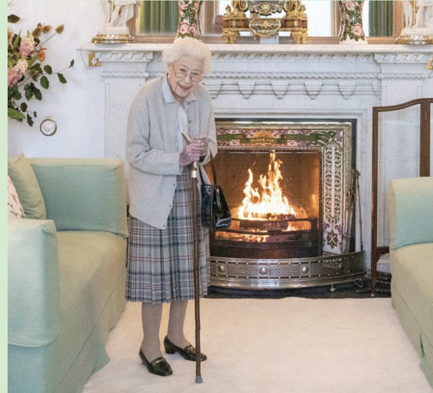
صورة الملكة الراحلة وهي تقف بجانب المدفئة في قلعة بالموال مُتَّكئة على عصا