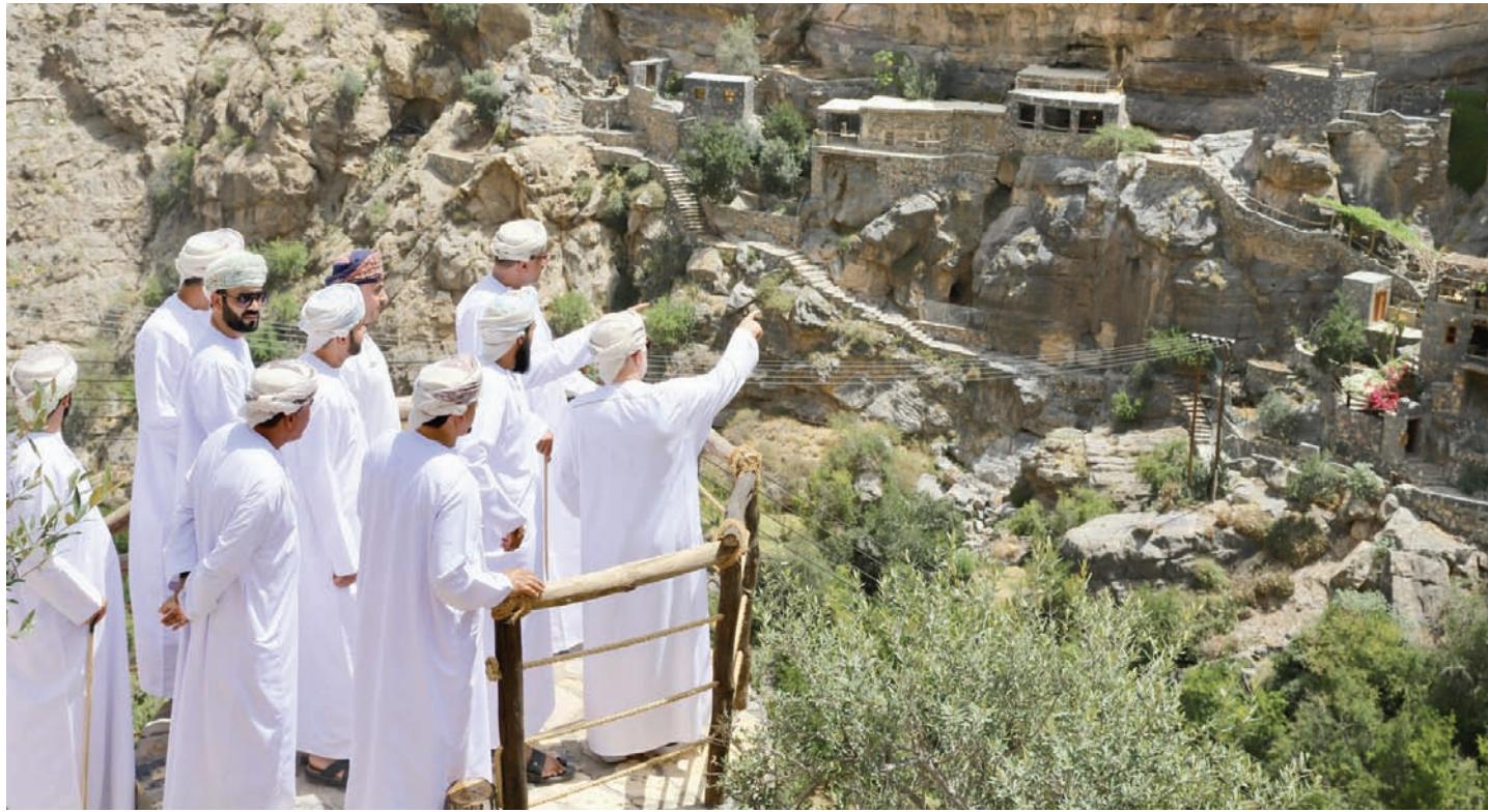
مسؤولون خلال افتتاح مشروع التطوير السياحي لقرية السجورة في ولاية الجبل الأخضر بسلطنة عمان

ارتفع حجم الاستثمارات الأجنبية المباشرة في سلطنة عمان بنسبة 23,3 في المائة على أساس سنوي في الربع الأول من العام الحالي، ليصل إلى 21,27 مليار ريال (55,72 مليار دولار) مقارنة مع 17,25 مليار ريال قبل عام.