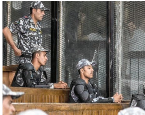
جلسة محاكمة سابقة لعناصر من «إخوان مصر» بتهمة الانضمام لجماعة إرهابية

من عناصر التنظيم اتجهوا حالياً إلى تأسيس منصات إعلامية وإنتاجية «تنشط في تقديم أعمال ومحتوى يجتذب التمويل، ويخدم في الوقت ذاته أهداف التنظيم، من بينها تقديم الرواية الإخوانية للأحداث». ويؤكد الباحث المتخصص في المنظمات المتطرفة أن التيار الجديد من عناصر «الإخوان» يستهدف «الجيل زد» (مواليد ما بين عامي 1996 و2013)، باستخدام محتوى جذاب، مثل الأفلام الوثائقية التي تحظى بمصداقية لدى هذا الجيل، الذي يقول إنه «لا يقبل على القراءة، ولا يميل إلى الاطلاع على تقارير متعمقة»، وهو ما يجعل، حسبها، ترويج الرواية الإخوانية باعتبارها «الرواية الحقيقية» الذي يصفه بـ«المسلح»، عبر محتوى مرئي، «أكثر انتشاراً في أوساط هذا الجيل»، لافتاً في هذا الصدد إلى حرص «الإخوان» على تقديم تلك الأعمال عبر شركات ومنصات «تُرجم الحياوية»، وعدم التبعية الرسمية للتنظيم، ما يجعلها أكثر قبولاً لدى قطاعات أوسع من الجمهور.