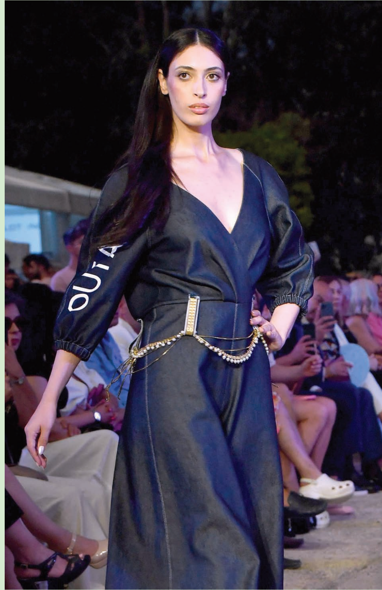
عازضة تقدم زياً للمصمم الفرنسي مود بينيتو في متحف فراج عند إطلاق «هوت كوتور»، «أوتا»، المصنوعة بالكامل من البلاستيك المعاد تدويره

- يا الله، كيف انقلبت الأمور رأساً على عقب؟! فاين دبي الآن من الخرطوم؟! الأولى تسابق الزمن، والثانية ذهبت ضحية (البرهان وحمدتي)!! - أي بين حانا ومانا - !!