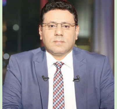
فارس البيل

تعلقاً على القرار الرئاسي اليمني بعودة المسؤولين إلى عدن وبقية المحافظات المحررة، يؤكد المحلل السياسي والأكاديمي اليمني فارس البيل، على أهمية الحضور الفاعل للحكومة على الأرض.