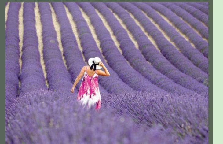
امرأة تقف في حقل خزامى في فالونسول جنوب فرنسا

وينتاشغ، فتاة من تابوان (33 عاماً)، ورغبت في زيارة هذه الحقول