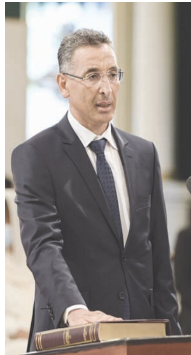
وزير الداخلية السابق توفيق شرف الدين

أعلن أعضاء في هيئات للدفاع عن مجموعة من المعتقلين السياسيين التونسيين، أمس، عن تقديم ثلاث شكاوى أمام المحاكم التونسية ضد توفيق شرف الدين، وزير الداخلية التونسية السابق، على خلفية اتهامه بتجاوز السلطة، واستعمال نفوذه الإداري في اعتقال بعض المتهمين، واحتجازهم بطرق غير قانونية.