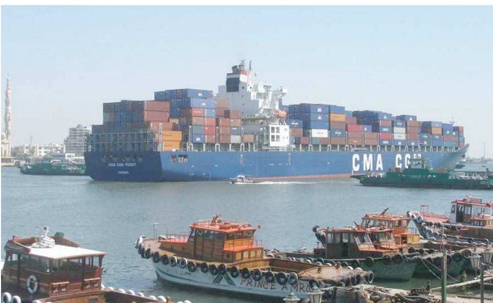
سفينة تحمل حاويات تمر عبر ممر قناة السويس

قال الفريق أسامة ربيع: «الدينا 7 شركات تابعة للهيئة، بينها شركات موجودة منذ 152 عاماً، أي منذ إنشاء وانحفاً في التجارة العالمية.