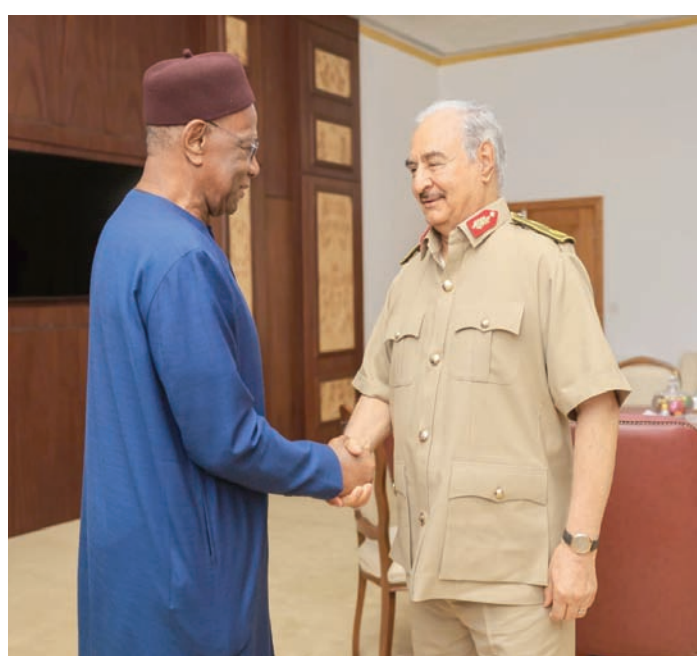
حفر لدى لقائه المبعوث الأممي عبد الله باتيلي في بنغازي (الجيش الوطني)

ان جمعية المصارف المركزية الأفريقية انتخبته رئيساً لمجموعة المصارف المركزية لشمال أفريقيا (مصر، والمغرب، وتونس، والجزائر، وموريتانيا والسودان)، وذلك خلال اجتماعاتها السنوية التي تم عقدها في غامبيا. وقال الصديق في بيان وزعه مكتبته، إن الاجتماع الـ45 لمحافظة البنوك المركزية الأفريقية، الذي اختتم أعماله الجمعة في زامبيا، انتخب الصديق نائباً لرئيس الجمعية خلال العام المقبل، مشيراً إلى أن هذه الجمعية ستعقد اجتماعها المقبل لعام 2024 في ليبيا، باستضافة من مصرفها المركزي. إلى ذلك، قال محمد المنفي، رئيس المجلس الرئاسي، إنه تلقى رسالة خطية من رئيس نيجيريا بولا أحمد تينيبو، قام بتسليمها معه، الخاص باباجانا كفي بي، الذي يقوم بجولة إلى ليبيا والجزائر، مشيراً إلى أن باباجانا قدم له شرحاً عن تطورات الموقف، في ضوء قرارات المجموعة الاقتصادية لغرب أفريقيا، التي انعقدت في أوجا الشهر الماضي. وأبدى المنفي ترحيبه بهذه الخطوة، التي عدّها تعزيزاً روح التشاور بين البلدين، وبقية الأشقاء في المنطقة وفي أفريقيا، من أجل الحفاظ على الاستقرار والسلم، والالتزام بعدم الاعتراف بالتغيير غير الدستوري لأنظمة الحكم المنتخبة، مؤكداً أهمية تضافر جهود دول جوار النيجر (ليبيا والجزائر وتشاد) مع أشقائهم في «إيكواس» للموصول بالأوضاع في النيجر إلى ما يحقق احترام الشرعية الدستورية، وتجنب كل ما من شأنه زعزعة الاستقرار في النيجر وفي الإقليم برمته.