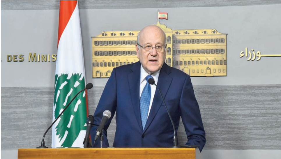
الرئيس نجيب ميفاتي

ويأتي ذلك بعد أيام من الاشتباكات المسلحة التي اندلعت في مخيم عين الحلوة للأجئين الفلسطينيين في صيدا بجنوب لبنان، حيث كانت تدور اشتباكات مسلحة بين مقاتلي «حركة فتح» وتحتلهم على سلامة مواطنيهم في لبنان». كما طلب من مولوي دعوة مجلس الأمن المركزي لانقاذ للبحث في التحديات التي قد يواجهها لبنان في هذه الظروف الإقليمية المتشعبة، واتخاذ القرارات المناسبة لحفظ الأمن في كل المناطق. وبعدما أشار بيان رئاسة الحكومة إلى تحذير من السفارة الألمانية