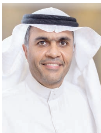
علاء الهمل (الشرق الأوسط)

ومن المقرر أن يبدأ الخليج مشواره في دوري المحترفين بمواجهة الفيحاء في ال13 من أغسطس (آب) الحالي.