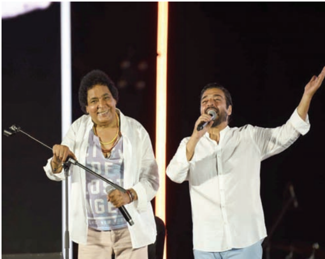
منير والشاعري يفتيان «أكيد» (صفحة المهرجان في فيسبوك)

خطف الفنانان محمد منير وحميد الشاعري الأنظار في مصر والعالم العربي خلال حفل «مهرجان العلمين»، الذي أقيم (مساء الجمعة) في مدينة العلمين الجديدة في مصر برعاية «الشركة المتحدة للخدمات الإعلامية»، خصوصاً لتقديمهما أغنية «أكيد» للمرة الأولى منذ 37 عاماً.