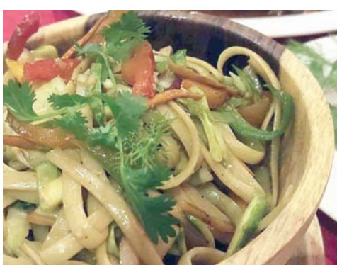
نودلز مقليه مشكّلة مليئة بالدجاج الجوسي والروبيان النضر مع أعشاب وتوابل عطرية (الشرق الأوسط)