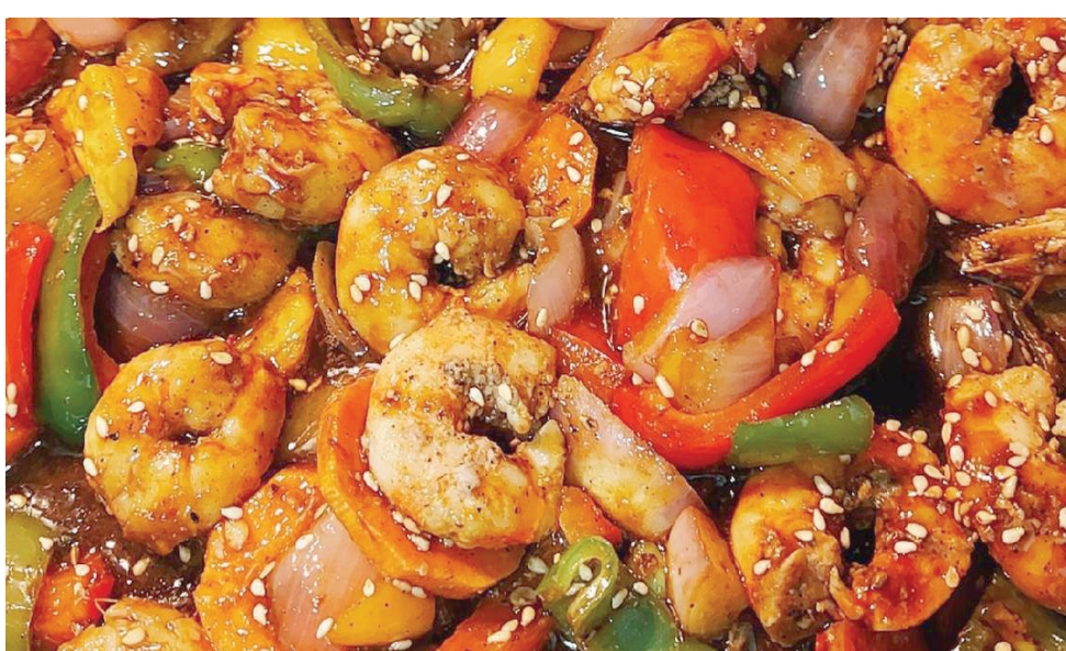
من أطباق الجمبري المميزة التي ستتركت تتطلع إلى تذوق المزيد (الشرق الأوسط)

وهناك ستجذب أوعية الفخار التي تقدم مع بعض المأكولات وتحافظ على المأكولات البحرية