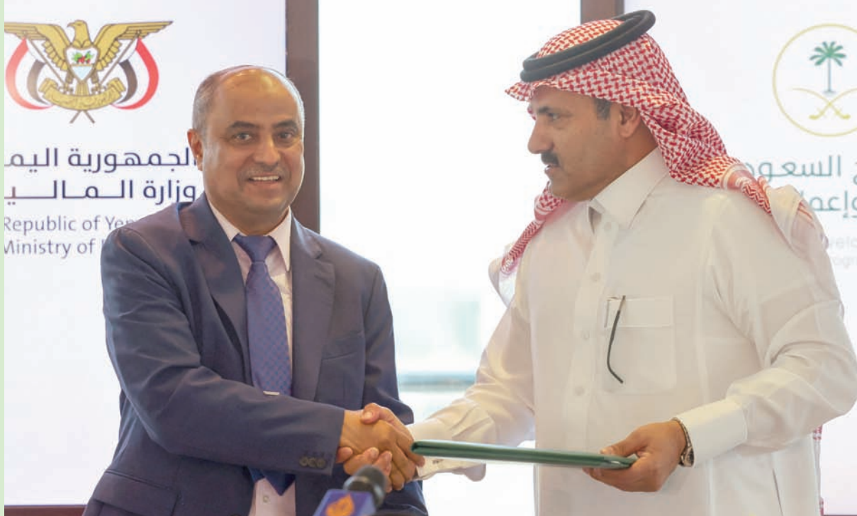
السفير السعودي محمد آل جابر بعد توقيع مع وزير المالية اليمني اتفاقية الدعم الجديد

الاقصدي، حيث كانت الميليشيات الحوثية تعتمد الضغط على الحكومة بتجفيف مصادرها المالية والاقتصادية، بعد توقيف تصدير النفط، ومنع دخول الغاز المنزلي من مارب إلى مناطق سيطرتها، وإجبار التجار على الاستيراد عبر ميناء الحديد لحرمات الحكومة من موارد كبيرة.