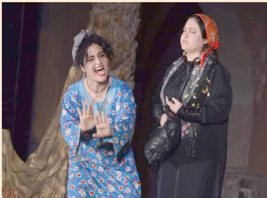
هموم حواء قضية محورية (مخرج العرض)