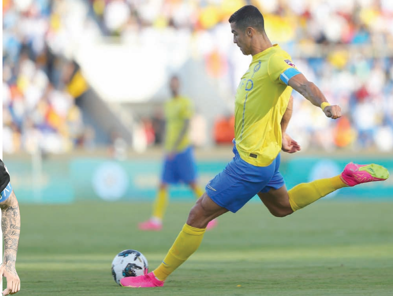
رونالدو يأمل بقيادة النصر نحو نصف النهائي العربي (نادي النصر)

يتحرك كثيراً في الوسط، ونحن نعلم ماذا ينتظرنا الأحد.