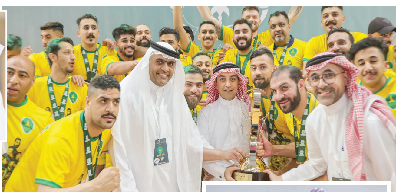
كرة اليد أحد أبرز الألعاب المنجزة للأرقام في الخليج

وقال الشعبي إن 30 في المائة من سعة الاستادات يجب ألا تتجاوز أسعار التذاكر فيها 20 ريالاً. وأضاف أن