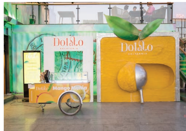
«دولاتو» نوع جديد من المثلجات في أسواق مصر

الرمضانية من الكنافة التي قدمناها على شكل مخروطي، كبديل إلى البسكويت التقليدي، يتزين في نهايته بالجيلاتو». وأضاف: «كذلك قدمنا (أم المصرية مع الحليب والمكسرات وحبّات الزبيب، بينما يهدأ دفاؤها حين تتلقى مع طبقة من جيلاتو