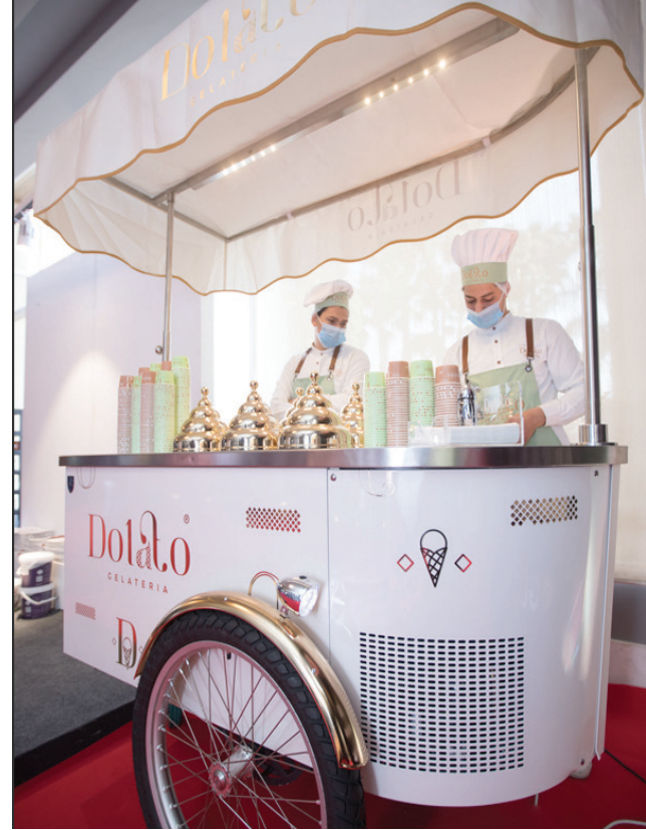
الجيلاتو يختلف عن الآيس كريم في الطعم والشكل وطريقة التصنيع (الشرق الأوسط)

يختلف الجيلاتو عن الآيس كريم المعروف في مصر والعالم، حيث يحتوي على نسبة أقل من الزبدة بنحو الثلثين، في حين يُعد محتواه من السكر أكثر نسبياً. ويُميز الجيلاتو كثافته التي تأتي بفضل طريقة التحضير الخاصة، فعلى عكس الآيس كريم، يحظى الجيلاتو بضررات طبيعية، ثم لا تتخلله فقاعات الهواء، كما هو في الآيس كريم، وهذه الطريقة تمنحه عمق المذاق والثخانة. كما يختلف الجيلاتو عن الآيس كريم كذالك في درجة التجمد، بالأول يجري تقيده في درجة التجمد، قليلاً من الثاني، وعادة ما يجري تخزينه في درجة حرارة من صفر إلى 10 درجات فهرنهايت، ويجري تقديمه عند 10 درجات إلى 20 درجة