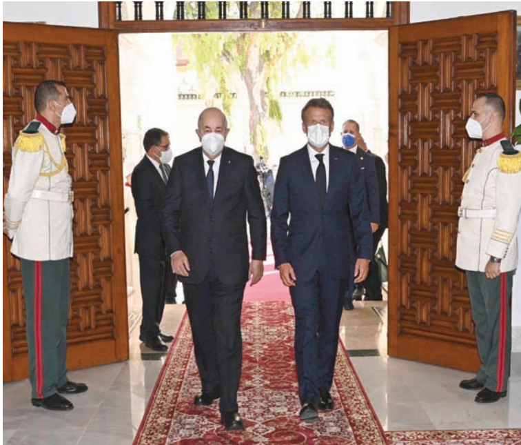
الرئيسان الجزائري والفرنسي في العاصمة الجزائرية في 25 أغسطس 2022