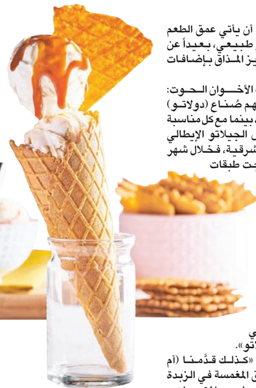
نكهات شرقية في قالب عربي