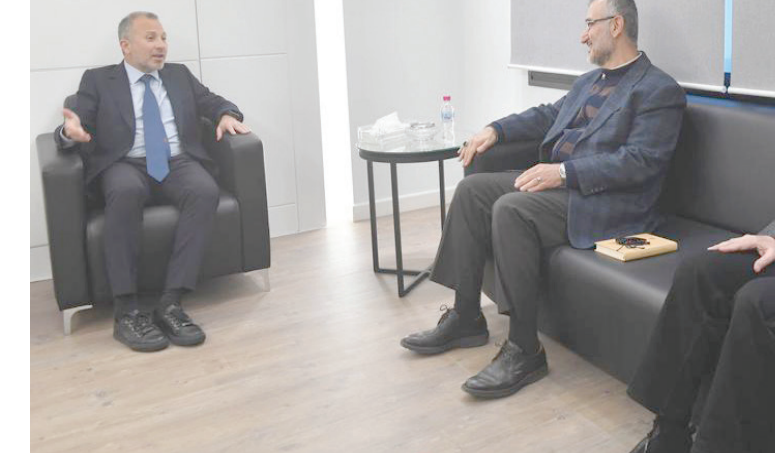
لقاء سابق بين جبران باسيل والمعاون السياسي أمين عام «حزب الله» حسين الخليل ومسؤول الارتباط في الحزب وقيف صفا

أما النائب في مجلس الأمة جراح الفوزان، فأكد أن «ما ذكره وزير الاقتصاد اللبناني يحتاج لتوضيح ورد عاجل من وزارة الخارجية، وهذا يُعد تجاوزاً على بلد المؤسسات (بشخطة قلم)». مضيفاً: «سنقدم تشريعاً قانونياً يتطلب موافقة مجلس الأمة