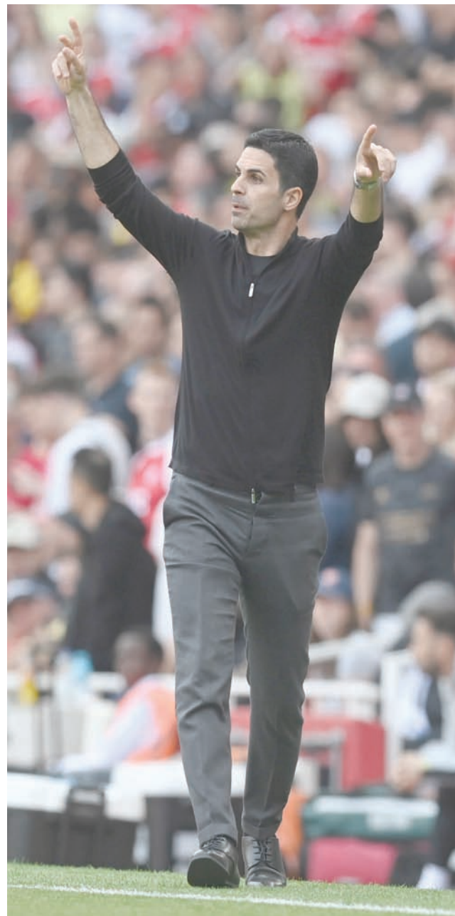
أرتيتا مدرب آرسنال

وانتهى رجال أرتيتا الموسم الماضي بفارق 5 نقاط خلف سيتي، وذلك بعدما كانوا متقدمين على الأخير بفارق 8 نقاط في أبريل (نيسان) قبل أن تتراجع نتائجهم تدريجياً. تفوق سيتي على منافسه الموسم الماضي في الدور الرابع من الكأس 0-1، وفي الدوري مرتين (3-1 و4-1). وقال أرتيتا: «بعد الذي قمنا به الموسم الماضي، من المؤكد أن هناك الكثير من الناس الذين سيحدثون عما يمكننا فعله الآن». مضيفاً: «في نهاية المطاف، يتعلق الأمر بأن تلعب بشكل أفضل وأن تكسب الأحقية في الخروج منتصراً من كل مباراة». وتابع: «قمنا ببعض التعاقدات الهامة، مثل كل الفرق الأخرى. لكن عندما تكون آرسنال، يتوجب عليك أن تعرف كيف تتعامل مع الأمر». وأوضح أرتيتا أن فريقه عازم