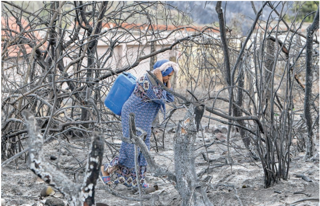
سيده تونسية تسير في إحدى الغابات التي التهمتتها الحرائق نتيجة ارتفاع الحرارة شمال غربي تونس قرب الحدود مع الجزائر

الصف، ولكن توجد عوامل أخرى تساهم في رفع درجات الحرارة إلى مستويات متطرفة. أول هذه العوامل هو التغيّر في كمية الطاقة المشعّة من الشمس التي ترتفع وتنخفض بشكل طفيف كل 11 عاماً. وتؤدي هذه الدورة في أعلى ذروة لها إلى زيادة تدفئة الأرض بنحو 0,05 درجة مئوية، ومن المتوقع أن تصل الشمس ذروتها المقبلة سنة 2025. والعامل الثاني هو ثوران البراكين تحت المائية، ولا سيما بركان تونغفا في جنوب المحيط الهادئ الذي أدى ثورانه في عام 2022 إلى تبخر كمية كبيرة من مياه البحر. ويمكن لبخار الماء، الذي يُعتبر من غازات الدفيئة القصيرة العمر، أن يرفع درجات الحرارة العالمية بأكثر من 0,03 درجة مئوية على مدى عدة سنوات. أما العامل الثالث فهو ظاهرة «النينيو»، التي ترتبط بتقلبات درجات الحرارة السطحية في الجزء الاستوائي من المحيط الهادئ، وتصحبا تغيّرات في دوران الغلاف الجوي فوق المنطقة. وعادة ما تحدث ظاهرة «النينيو» بشكل طبيعي، لكنها تؤثر بقوة على أنماط الطقس والمناخ في أنحاء كثيرة من العالم. وحسب المنظمة العالمية للأرصاد الجوية، وصلت درجات حرارة سطح البحر في العالم إلى مستوى قياسي خلال الأشهر الثلاثة الماضية، ما يعني أن نطق طقس «النينيو» الاحتراري قد بدأ لتلو. ورفعت ظاهرة «النينيو» القوية