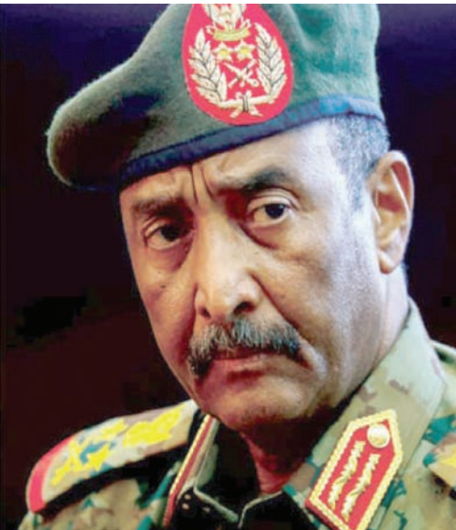
إبراهيم رئيس «السيادة» قائد الجيش

ينطوي على مخاطر كبيرة، وفق مهدي. وأضاف: «غالبية الذين يتحركون خارج المنطقة يتعرضون للنهب، وأحياناً للضرب والترويع والاعتقال من قبل قوات عسكرية».