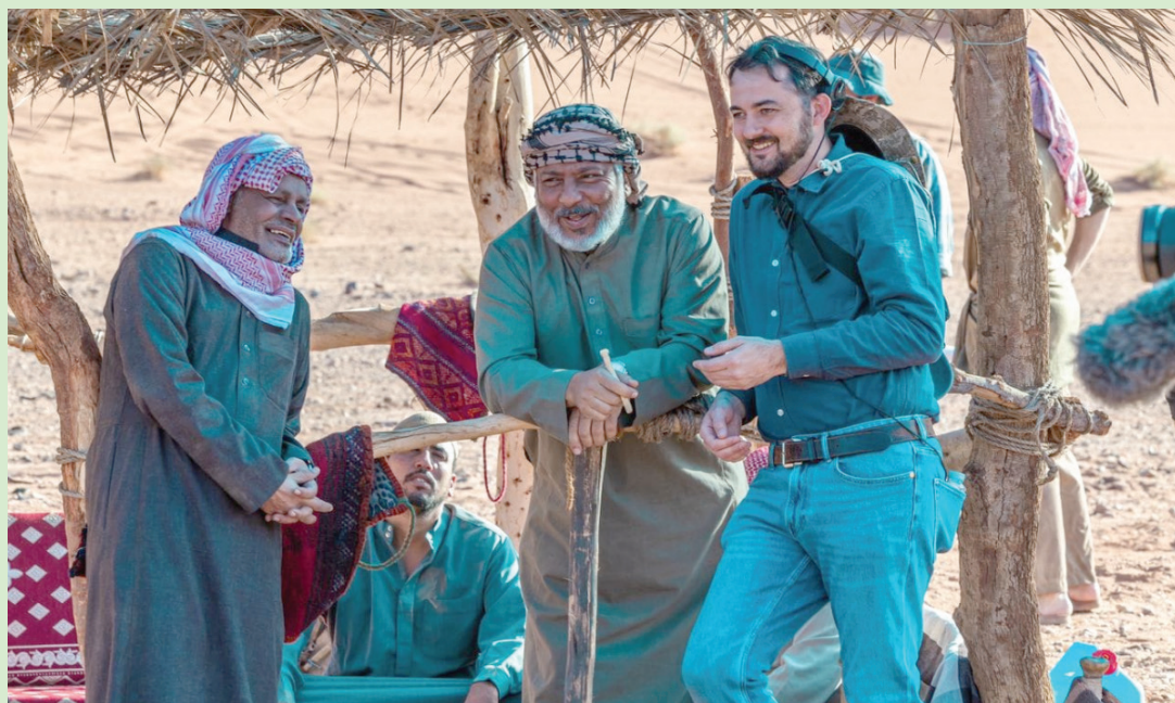
فريق العمل خلال تصوير أحد المشاهد في الصحراء السعودية (موقع المهرجان)

مخرج الفيلم أبو بكر شوقي، المصري النمساوي، الذي تعاون مع حفطي في فيلمه الروائي الطويل الأول «يوم الدين»، الذي شارك في المسابقة الرسمية لمهرجان «كان» عام 2018، يعود مجدداً للتعاون معه في «هجان». ولكن «عبر تجربة مختلطة»، حسب حفطي. وينتهي شوقي حالياً بعض العمليات الفنية الأخيرة للفيلم في باريس، وقد وصف العمل بقوله إنه «قصيدة