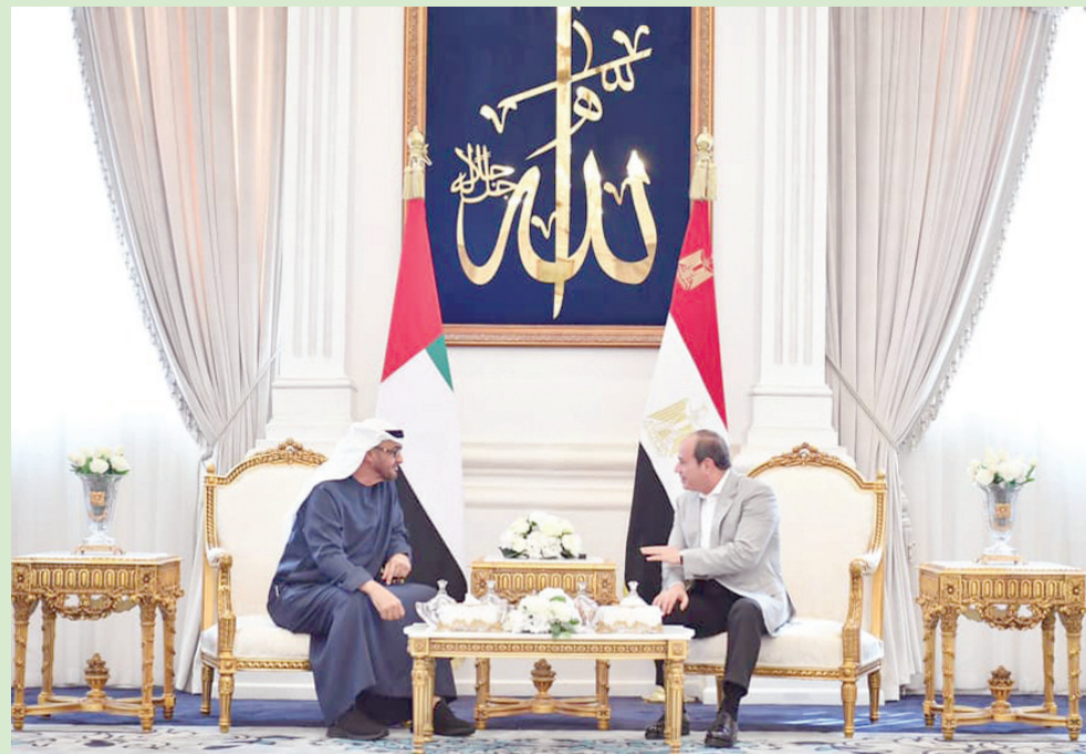
السيسي خلال لقاء الشيخ محمد بن زايد في مدينة العلمين

على النحو الذي يحقق تطلعات الشعبين المصري والإماراتي نحو التقدم والاستقرار والأزدهار». وأوضح البيان الرئاسي المصري أن الرئيسين بحثا مستجدات الأوضاع الإقليمية والدولية، حيث «تطابقت الرؤى بشأن أهمية تكثيف العمل العربي المشترك لمواجهة التحديات المتنامية في المنطقة والعالم». وأكد الرئيسان، خلال اللقاء، حرصهما على «مواصلة التنسيق الوثيق على جميع المستويات، في ضوء ما يربط البلدين من أواصر تاريخية وطيدة على المستويين الرسمي والشعبي».