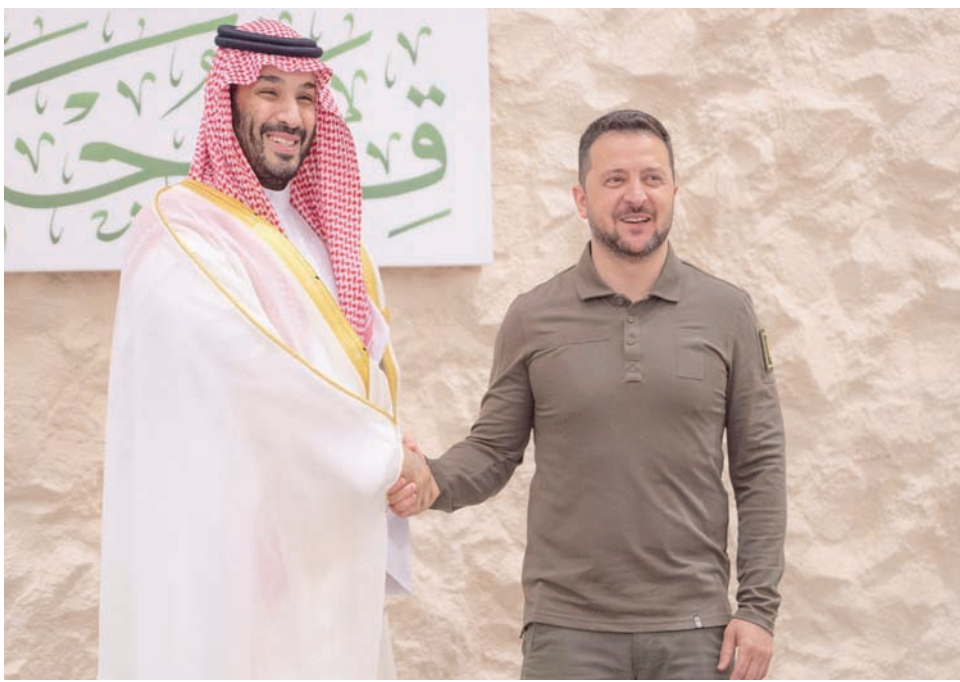
ولي العهد السعودي خلال استقباله الرئيس الأوكراني على هامش القمة العربية في جدة مايو الماضي

وكان السياسي الأميركي المخضرم هنري كيسنجر قال في مايو (أيار) الماضي إن المفاوضات لتحقيق السلام في أوكرانيا يمكن أن تتم في