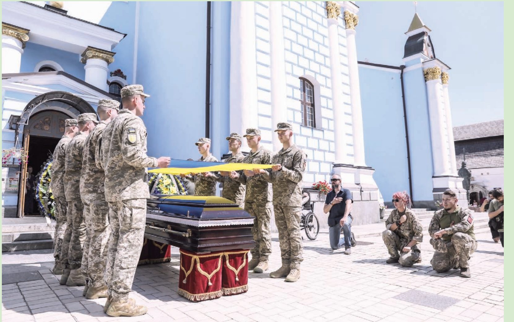
جنود أوكرانيون يضعون العلم الوطني على نعش أحد رفاقهم أمام كنيسة في كييف أمس

وأكد الجانبان، أمس السبت، أن زورقاً أوكرانياً مسيراً يحمل متفجرات اصطدم بناقلة وقود روسية الليلة الماضية بالقرب من جسر يربط روسيا بشبه جزيرة القرم، في ثاني هجوم من نوعه خلال 24 ساعة. وأندرت كييف أمس بأن ستة موانئ روسية مطلة على البحر الأسود، وهي أنابا ونوفوروسيسك وجيلينجيك وتوايس ولختر الاستهداف في الحرب». (تفاصيل ص 9)