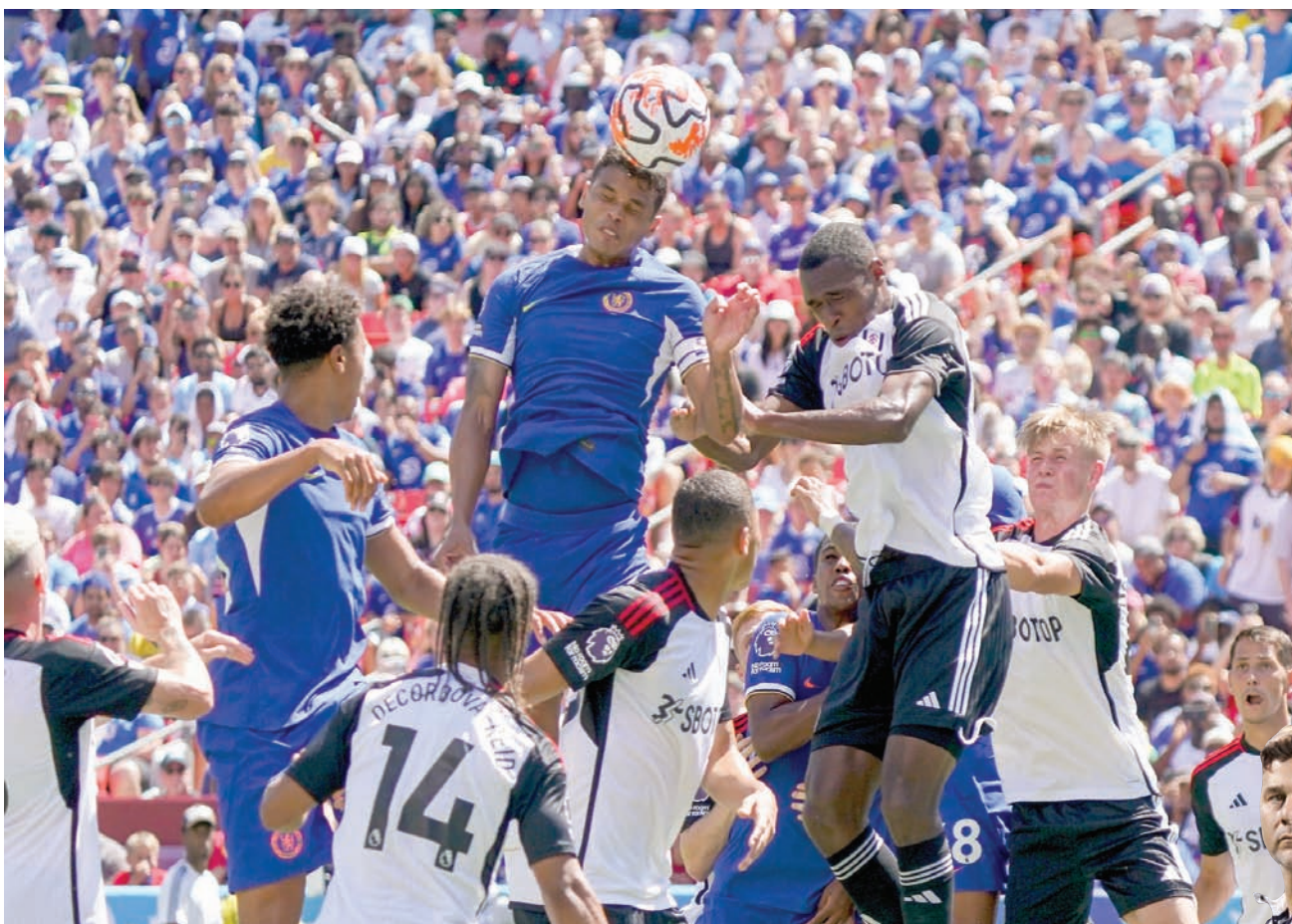
تشيلسي في مواجهة ودية مع فولهام ضمن استعدادات الفريقين للموسم الجديد (أ.ب.)

بوكيتينو أمام مهمة إعادة تشيلسي إلى صفوف الكبار (أ.ب.)