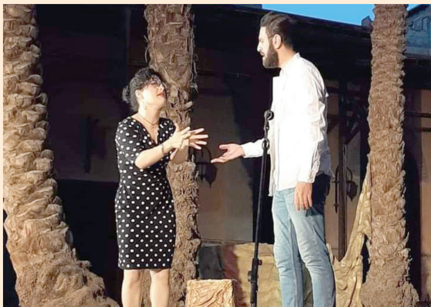
هموم ضاغطة تدفع إلى هاوية الاكتئاب (مخرج العرض)

يلتقي الشاب بفتاة تشبهه في حالة الإحباط هي الأخرى، وبمجرد أن يتجادبا أطراف الحديث يتبين