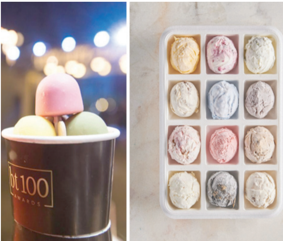
نكهات مختلفة من الجيلاتو (الشرق الأوسط)

الغانبلا، وحتى البسبوسة استبدلنا بطبقات القشدة طبقات الجيلاتو». وعن طريقة التصنيع يقول الأخوان الحوت: «تحضير الجيلاتو يكون داخل مصنعنا الخاص، من خلال فريق إنتاج مدرب تحت إشراف إيطالية بمواد خام تأتي من إيطاليا لتدخل عملية الإنتاج، ما يعني أن (دولاتو) علامة مصرية بثقافة إيطالية».