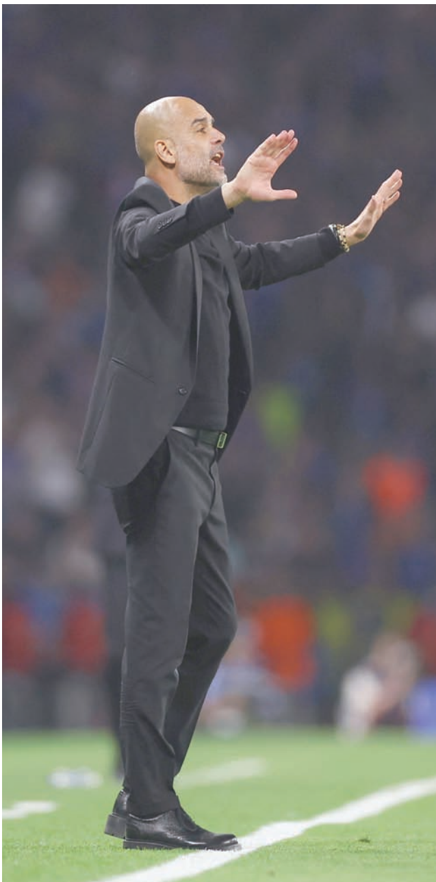
غوارديولا مدرب مانشستر سيتي

غفارديول، ضمن مسعاه لضخ دماء جديدة والإبقاء على حماس وتعطش الفريق.