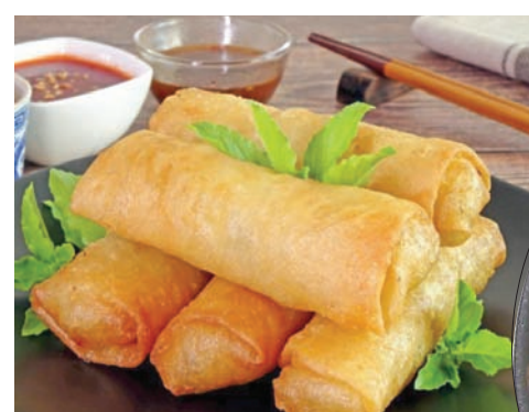
سبرينغ رولز لحم بقري باللصوص المميز (الشرق الأوسط)

مصنوع من محار بلامب المالح، ومزيج من التوابل العطرية».