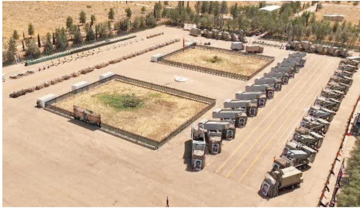
صورة تُظهرها وكالة «تسنيم» التابعة له الحرس الثوري، لأسلحة وأنظمة صواريخ أمس

واصل «الحرس الثوري» الإيراني برامجته الاستراتيجية بتزويد وحدته البحرية بطائرات مسيرة وصواريخ «مزودة بالذكاء الاصطناعي»، يبلغ مداها 1000 كيلومتر، في وقت أرسلت فيه الولايات المتحدة تعزيزات لردع التهديدات البحرية، وعرضت في أحدث خطوة توفير حراس للسفن التجارية التي تمر عبر مضيق هرمز في الخليج العربي. وذكرت وكالة «إرنا» الرسمية أن «أنواعاً مختلفة من الطائرات المسيرة... وعدة مئات من صواريخ كروز والصواريخ الباليستية، التي يتراوح مداها بين 300 و1000 كيلومتر من بين الأنظمة والمعدات التي أضيفت إلى قدرات بحرية (الحرس الثوري) اليوم»، حسبما أوردت «رويترز».