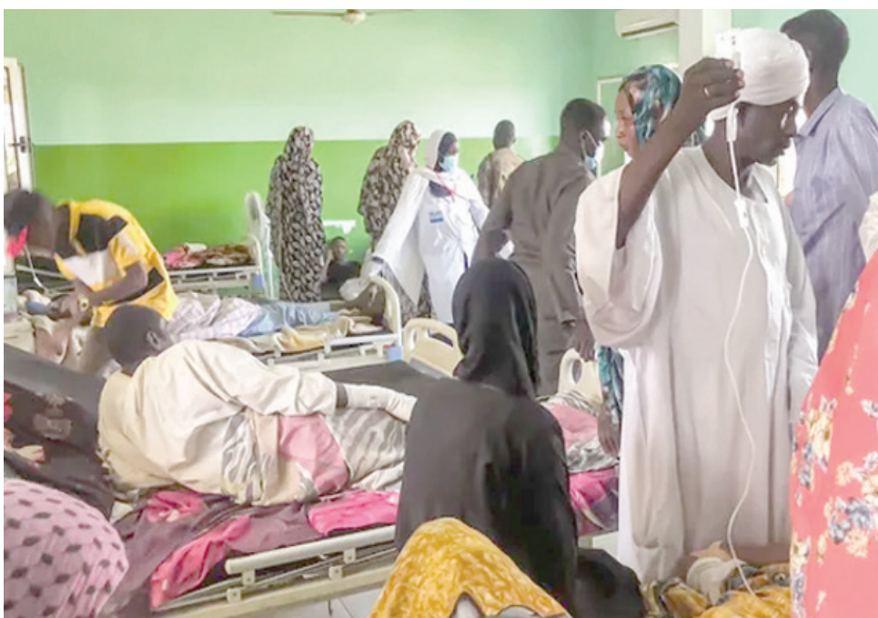
أوضاع السودان تسببت في دمار نظامها الصحي

وفي إقليم دارفور بغرب السودان، الذي يعاني أيضاً من اقتتال واسع، تعمل جاهدة كوادر طبية في مدينة الفاشر عاصمة الإقليم، لتوفير رعاية صحية لمئات الأطفال المرضى والمصابين بسوء التغذية بعد إغلاق مستشفى الأطفال الرئيسي بسبب الاشتباكات. ويقول مسؤولو المستشفى إن قوات «الدعم السريع» حولته إلى ثكنة عسكرية، وإن أجزاء واسعة منه تعرضت للتدمير بسبب سقوط قذائف عليه في الاشتباكات. وبعد إغلاق المستشفى قرر أفراد الكادر الطبي إقامة مركز علاجي لتقديم خدماتهم للأطفال من داخل خيام في منطقة مكتوفة تشهد اكتظاظاً كبيراً بالمرضى وذويهم وسط