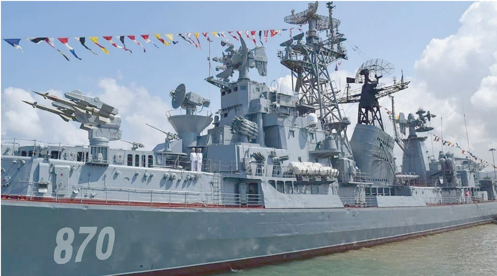
من الاستعراض البحري للأسطول الروسي الأخير في ميناء طرطوس على الساحل السوري

بين الملفات الموضوعية على طاولة المقداد أيضاً، الاعتداءات الإسرائيلية على الأراضي السورية، إلى جانب ملف وجود القوات الأميركية في سوريا، وهو الموضوع الذي بات يشغل بول موسكو كثيراً خلال الأسابيع الأخيرة، خصوصاً على خلفية تزايد الاحتكاكات في الأجواء السورية بين