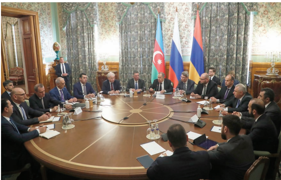
المحادثات الثلاثية التي رعتها روسيا بين أذربيجان وأرمنيا الأسبوع الماضي