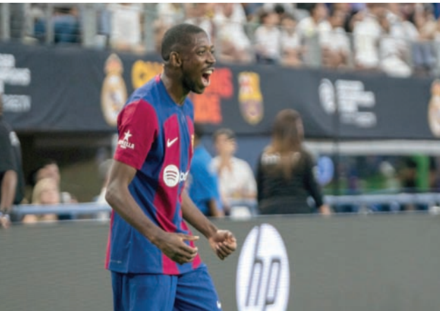
ديمبيلي وافق على الانتقال لسان جيرمان

وعادت البرازيلية المخضمة في فبراير (شباط) الماضي فقط إلى الملاعب، خلال فوز البرازيل على اليابان 1-0 في كأس «شني بيلغيف». وقالت بعد المباراة: «هي المرة الأولى التي أمضيت فيها فترة طويلة من دون أن أعب. لقد عانيت كثيراً».