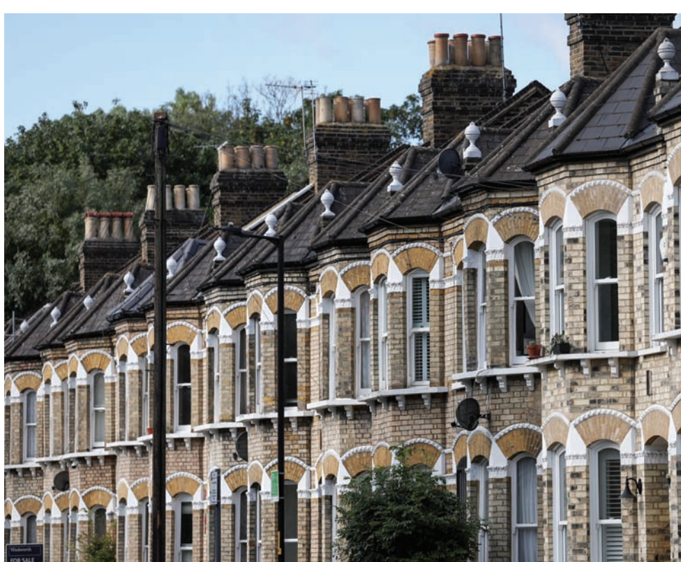
تراجعت أسعار المنازل البريطانية في يوليو على أساس سنوي بأكثر قدر منذ عام 2009

وقال الاتحاد إن الملابس والأحذية كانت أكبر دافع هبوطي لأسعار المتاجر في يوليو، بينما انخفضت أسعار المواد الغذائية إلى أدنى مستوى له هذا العام. وقالت هيلين ديكسون، الرئيس التنفيذي للاتحاد، إن هذه الأرقام تثير التفاؤل، لكن المزيد من مشكلات سلاسل التوريد قد تضاف إلى تكاليف المدخلات لبحار التجزئة في الأشهر المقبلة. وتابعت أن «انسحاب روسيا من مبادرة الحبوب في البحر الأسود والاستهداف اللاحق لمنشآت الحبوب الأوكرانية، وكذلك القيود على تصدير الأرز من الهند، هي غيوم مظلمة تلوح في الأفق». وأظهرت أحدث البيانات الرسمية أن معدل التضخم المرتفع في بريطانيا انخفض بختر من المتوقع في يونيو، وكان في أبطأ مستوى له منذ أكثر من عام عند 7,9 في المائة، وعلى الرغم من تباطؤ التضخم، يعتقد الاقتصاديون أن بنك إنجلترا سيرفع أسعار الفائدة يوم الخميس إلى 5,25 في المائة، من 5 في المائة حالياً. وقام بنك إنجلترا بزيادة الضغوط على بنك إنجلترا تراجع الصناعات الحاد، وأظهر مسح يوم الثلاثاء أن إنتاج المصانع البريطانية انكمش في يوليو بأسرع