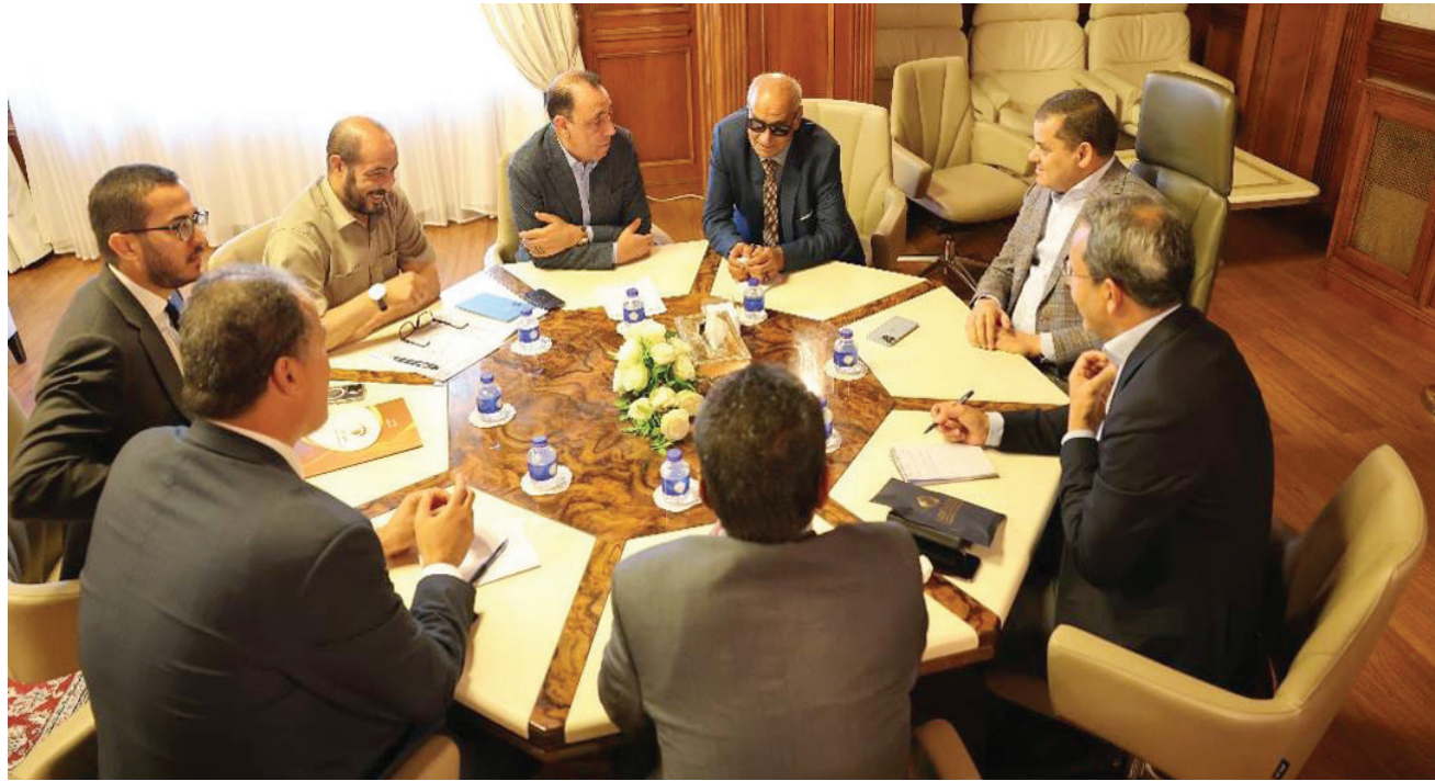
جانب من لقاء الديبية مع عميد بلدية طبرق (حكومة الوحدة)