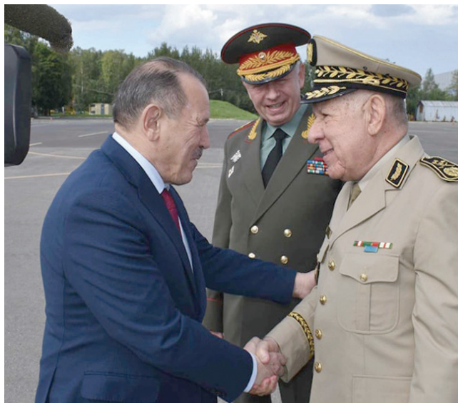
قائد الجيش الجزائري مع مدير المصلحة الفيدرالية للتعاون العسكري والفني فيدرالية روسيا (الدفاع الجزائرية)

وذكر بيان لوزارة الدفاع الجزائرية، أمس الثلاثاء، أن شقريحية وجد في استقباله في مطار موسكو الفريق أول الكسندر فومين، نائب وزير الدفاع الروسي، وديميتري شوغاييف مدير المصلحة