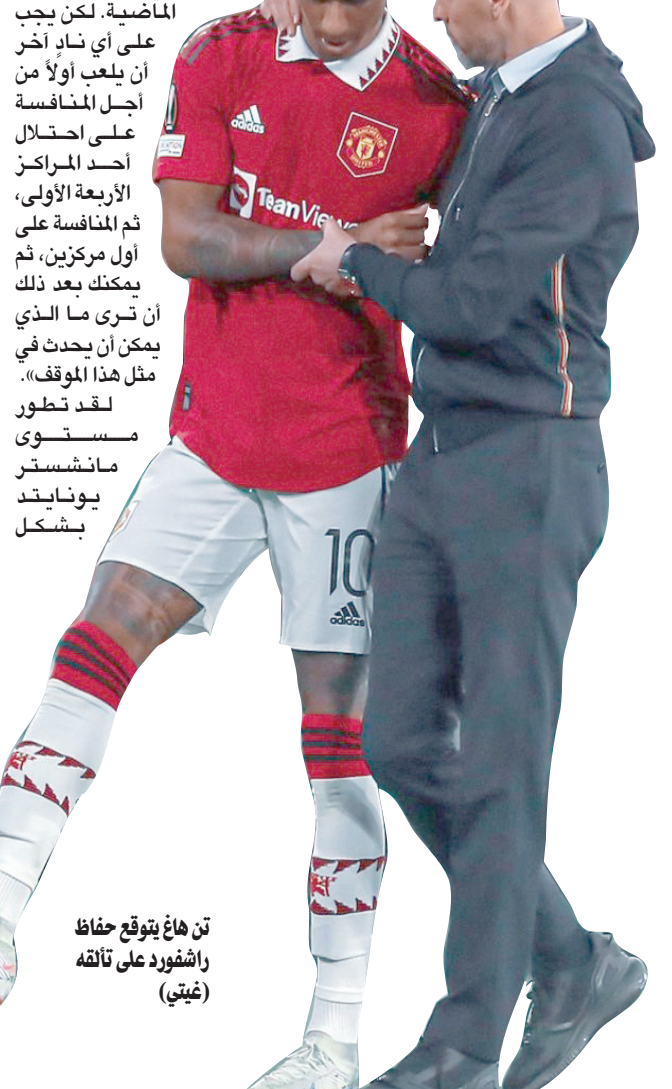
تن هاغ يتوقع حفاظ راشفورد على تألقه

المنافسة القوية على اللقب في البطولة الماضية رفعت من سقف التوقعات