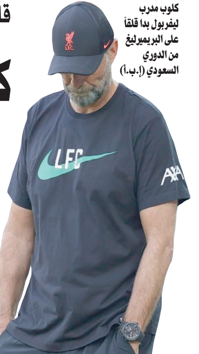
كلوب مدرب ليفربول بدأ قلقاً على البريميرليغ من الدوري السعودي

أعرب الألماني يورغن كلوب مدرب ليفربول الإنجليزي عن قلقه من استمرار نافذة الانتقالات الصيفي في السعودية وسط إغلاق الميركاتو الصيفي في أندية أوروبا بنهاية الشهر الحالي. ووسط هجرة أفضل لاعبي أوروبا إلى الدوري السعودي الذي بات سوقاً مفضلة لدى الكثيرين منهم ناشد مدرب ليفربول السلطات الكروية في «فيفا» و«ايويفا» إيجاد حل له. وكشف كلوب في مؤتمر صحافي في سنغافورة عشية