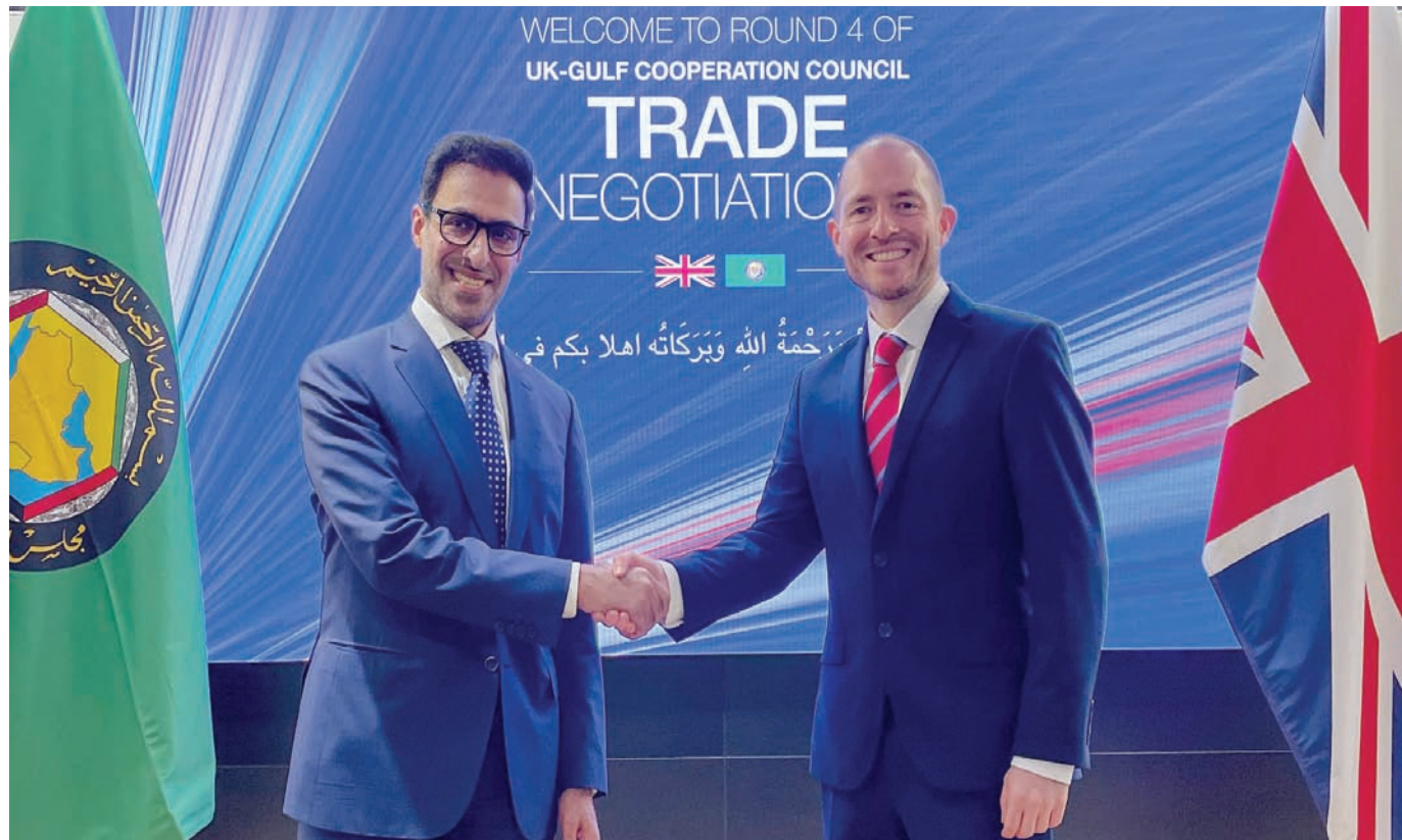
كبير المفاوضين البريطاني توم وينتل مع نظيره الخليجي الدكتور رجا المرزوقي (الشرق الأوسط)

بن مناحي المرزوقي، بشاظرنا هذا النهج». وأكد: «عملت فرق المملكة المتحدة ودول مجلس التعاون الخليجي معا بصورة وثيقة للغاية، ونحن نتقاسم الطموح نفسه. ونطمح إلى اتفاقية للتجارة الحرة ترجع بالنفع على اقتصاداتنا كافة».