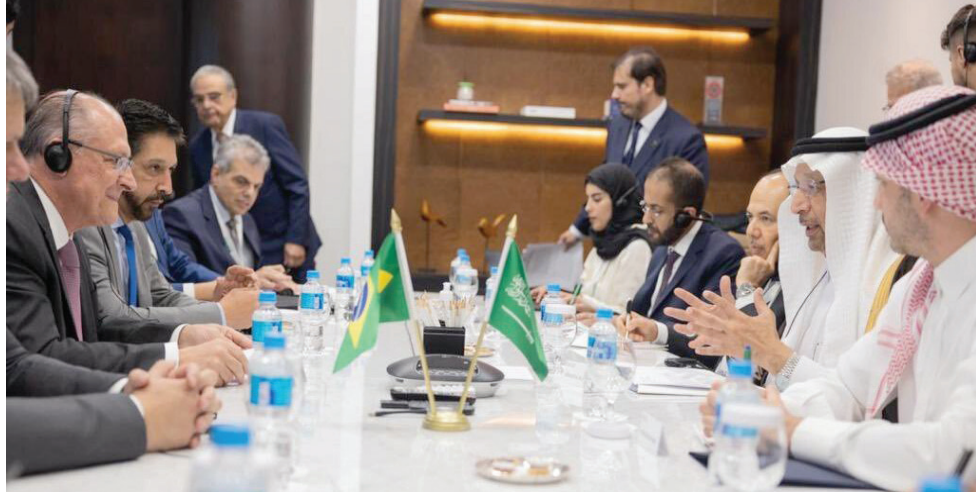
جانب من لقاء نائب رئيس البرازيل مع وزير الاستثمار السعودي

والإطار المالي الجديد. وأشار نائب رئيس البرازيل إلى أهمية السعودية كشريك تجاري رئيسي في الشرق الأوسط، مع حجم تبادل بقيمة تتخطى 8,2 مليارات دولار في العام المصيرم. وكان وزير الاستثمار السعودي قد دعا جميع الشركات البرازيلية العملاقة لاكتشاف الفرص الاستثمارية المتاحة حالياً في المملكة، مبيناً أن القطاع الخاص في البلدين أمام تعاون استثماري مشترك في عدة مجالات أبرزها: الأمن الغذائي، والسياحة، وسلاسل الإمداد. وأوضح أن بلاده تعد أكبر مصدر للسلع إلى البرازيل بين الدول العربية، مفيداً بأن البلدين لديهما الطموح