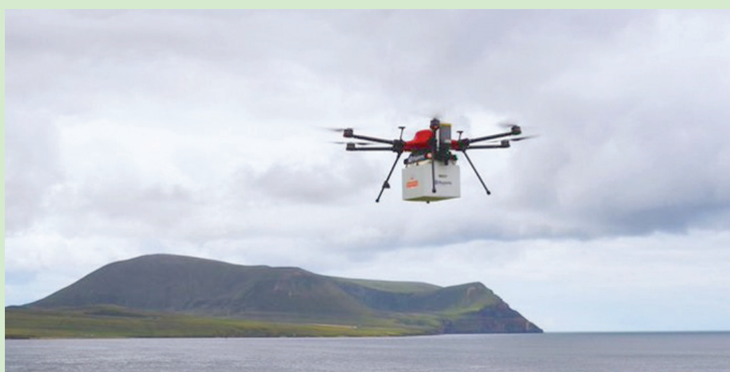
خدمة لتوصيل بالطائرات المُسيّرة (رويال ميل)