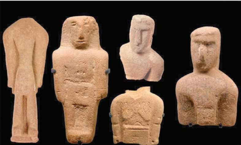
5 تماثيل نذرية محفوظة في متحف الغلا مصدرها جبل أم الدرج