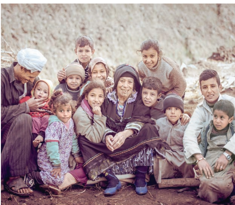
الترباط الأسري من أهم سمات حياة القبائل العربية (الشرق الأوسط)