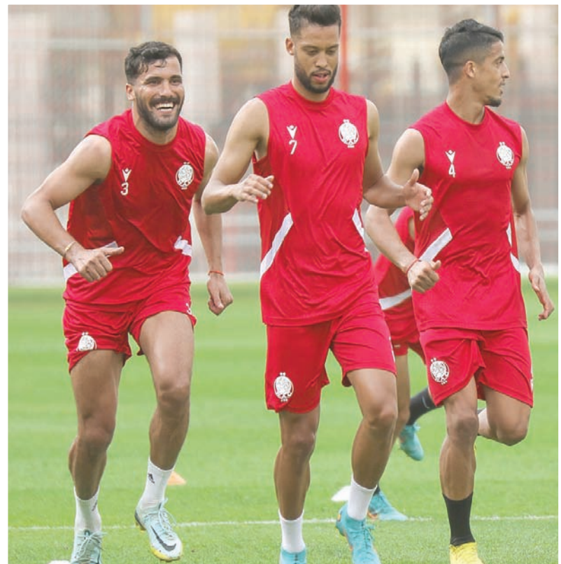
الوداد البيضاوي خلال التدريبات تأهباً للمباراة الحاسمة