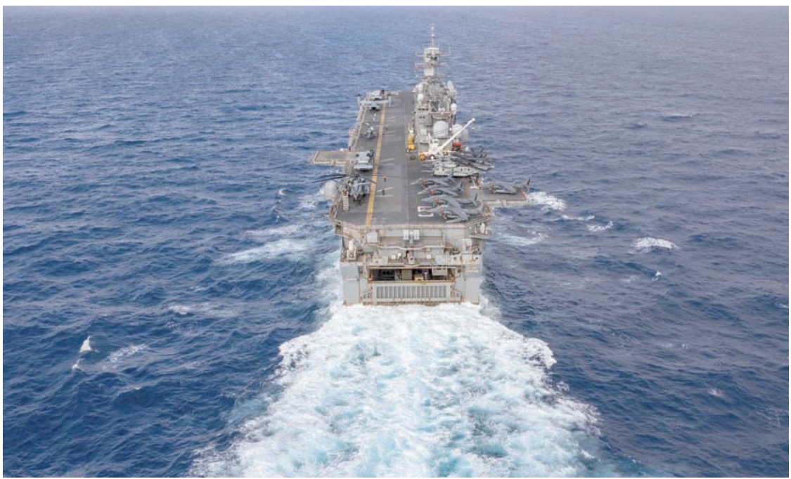
حاملة الطائرات الأميركية «يوا إس باتان» تبحر في المحيط الأطلسي على طريقها إلى الخليج العربي في 20 يوليو 2023

2» الأسبوع الماضي. إن سيكون للولايات المتحدة جزء من وحدة مشاة البحرية الاستطلاعية في المنطقة للمرة الأولى منذ ما يقرب من عامين. وينتشر آلاف من قوات «المارينز» والبحارة على متن