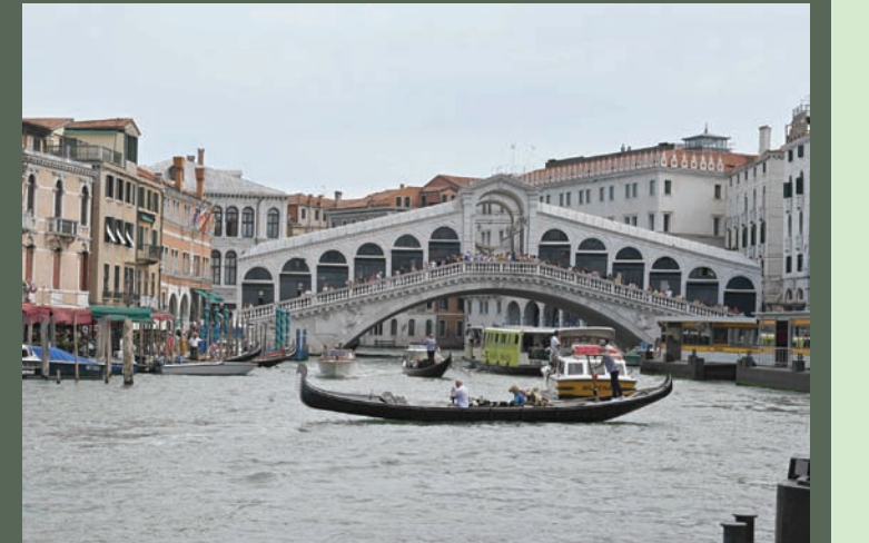
سائحون يركبون الجندول عبر القناة الكبرى

ويجري خبراء مركز التراث العالمي التابع لـ«اليونسكو» مراجعة منتظمة لحالة 1157 موقع تراث عالمياً مدرجاً