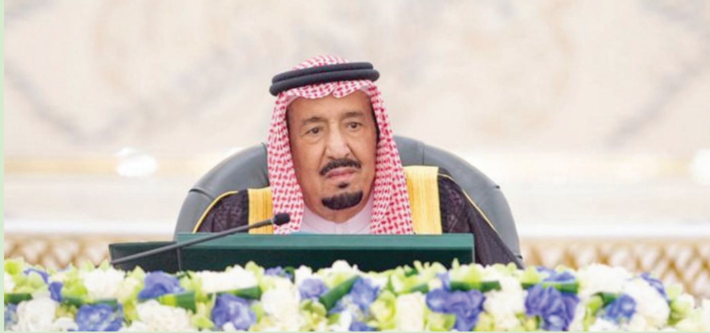
خادم الحرمين الشريفين متراًساً جلسة مجلس الوزراء (واس)

الوزراء أعرب في هذا الصدد عن ارتياحه للنتائج المحققة من الإصلاحات الاقتصادية والمالية الهادفة إلى تعزيز النمو الاقتصادي الشامل، وتقوية المركز المالي للمملكة بما يضمن الاستدامة المالية نحو اقتصاد مزدهر.