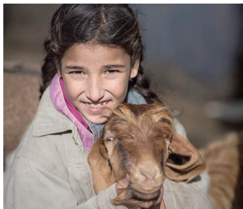
فتاة صغيرة تساعد أسرتها في رعاية الغنم

«الشرق الأوسط»: «هم لا يندمجون بسهولة مع السكان الأصليين، لكنهم يعرفون بالوان ملابسهم الزاهية، ويمواهبهم الفنية المتعددة، وبراعتهم في الأعمال البدوية، ما يعطي انطباعاً رائعاً عنهم في قلوب سكان هذه المناطق».