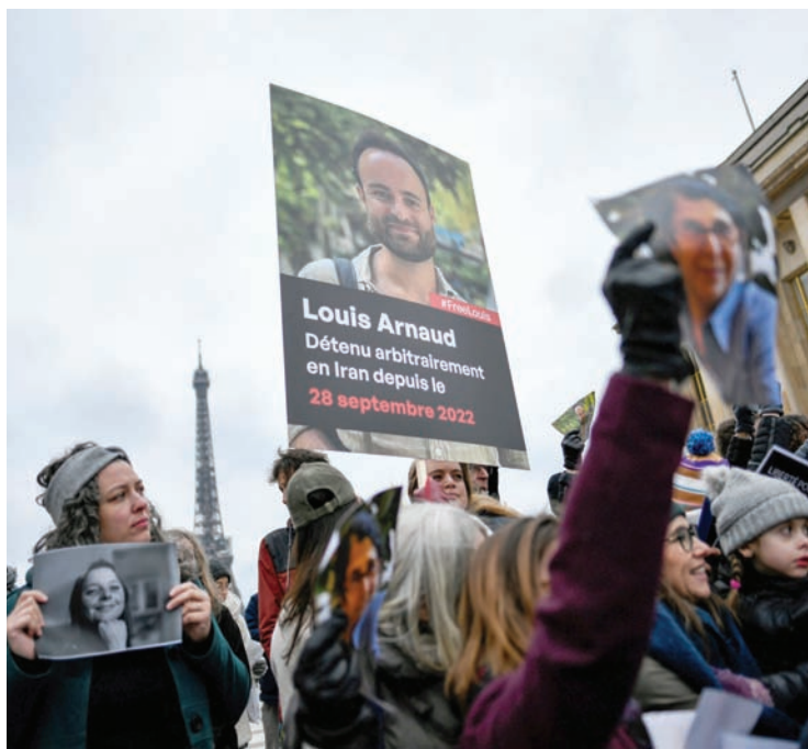
متظاهرون في باريس خلال يناير الماضي يطالبون بإطلاق سراح أرنو