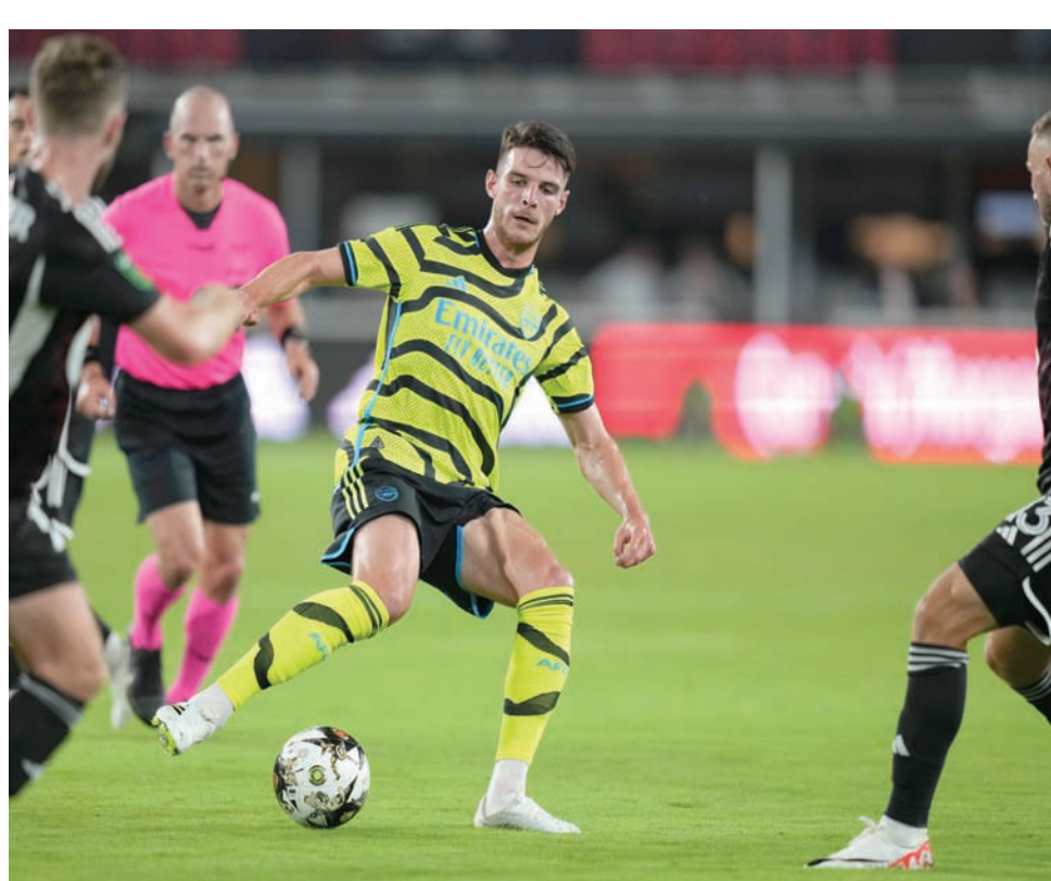
ضم آرسنال رايس تدعم لصفوف الفريق في سياق المنافسة على اللقب (أ.ب)

يعد ساكا تجسيداً حياً لحالة آرسنال في الوقت الحالي. إننا لا نرى لاعبين بهذه الإمكانيات الكبيرة سوى مرة واحدة فقط في كل جيل؛ لاعب صاعد من أكاديمية الناشئين، ومعشوق للجماهير، وشق طريقه إلى النجومية بكل أناقة ورساقة. وعلاوة على ذلك، فإن أداءه يتحسن ويتطور بشكل كبير كل موسم، وأصبح معشوقاً لجماهير آرسنال التي تشجع بحماس بصم الأذان عندما ينطلق النجم الإنجليزي الشاب بسرعه الفائقة ومهاراته الفذة على