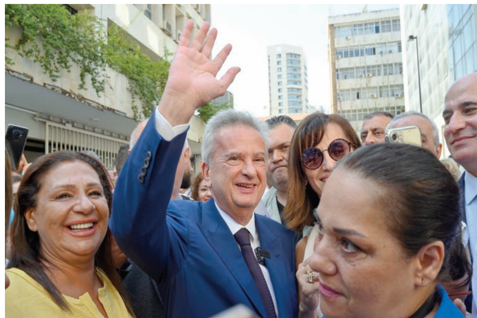
رياض سلامة مغافراً «مصرف لبنان» في اليوم الأخير من ولايته يوم الاثنين (أ.ب.أ)

مشروعة للمودعين في البنوك، بوصفها الرصيد المتحقي والمفقود للتوظفبات الإلزامية التي أودعتها البنوك وبنسبة 14 في المائة من مدخرات خاصة لمقيمين وغير مقيمين من أفراد ومؤسسات، وبما يشمل الحقوق العائدة لمودعين غير لبنانيين، وأغلبهم