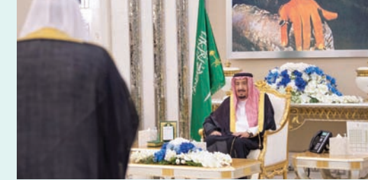
خادم الحرمين خلال أداء السفراء الجدد القسم أمامه

حضر أداء القسم، المهندس وليد بن عبد الكريم الخريجي نائب وزير الخارجية، وتميم بن عبد العزيز السالم مساعد السكرتير الخاص لخادم الحرمين الشريفين.