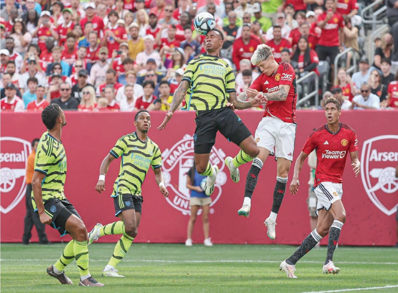
مانشستر يونايتد وآرسنال في مواجهة ودية استعداداً للموسم الجديد (رويتزر)