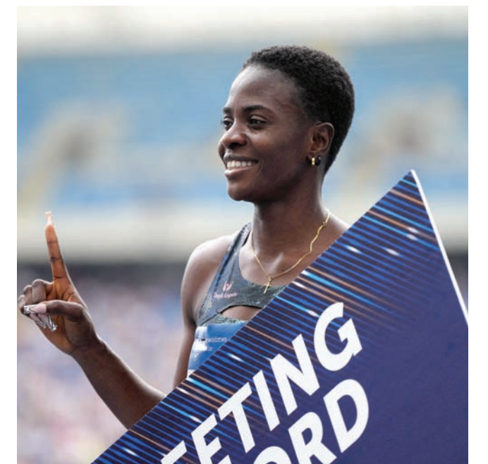
التجريبية أموسان بطلّة سباق 100 متر حواجز تواجه خطر الإيقاف

توقع رئيس الاتحاد الدولي لألعاب القوى البريطاني سيباستيان كو نجاحاً كبيراً لبطولة العالم التي تستضيفها بودابست هذا الشهر، وأنها ستكون الأفضل على الإطلاق فيما يتعلق بالاداء، والأرقام القياسية والحضور الجماهيري. وبسبب جائحة فيروس كورونا ستقام بطولة العالم في عامين متتاليين بدلا من مرة كل عامين، بعد تأجيل النسخة الماضية في بوجين بولاية أوريغون الأمريكية من 2021 إلى العام الماضي. وتستضيف بودابست النسخة الجديدة من البطولة في الفترة 19-27 أغسطس (أب) الحالي. وقال كو على هامش التحضير للافتتاح: «أعتقد أنها البداية الأفضل لأي موسم لألعاب القوى. كنت محظوظا جدا، فقد حضرت المرة الأولى (من ثلاث) عندما كسرت فيث كيبيجون الزمن العالمي لتفوز بسباق 1500 متر في