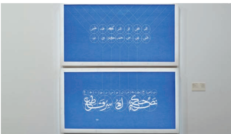
التفاصيل الفنية المتقنة في أحد أعمال عبد الرحمن الشاهد (وزارة الثقافة)