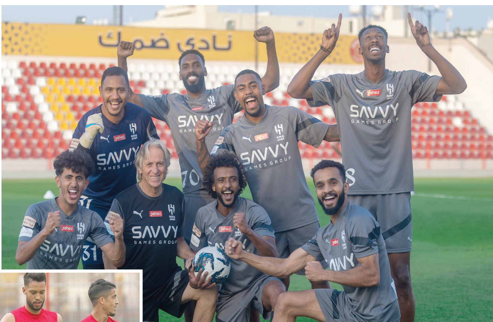
الهلال يواجه خطر الهبوط من البطولة العربية (نادي الهلال)

ويلوح في الأفق كلاسيكو مرتقب بين الاتحاد والهلال، وذلك في حال استمرار