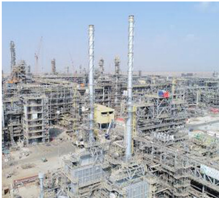
جازان توفر 10 فرص استثمارية بحجم استثمار يقدر بـ400 مليون دولار (الهيئة الملكية)

وفي الختام، إن سعة وعمق هذه التغييرات يشيران بتحول لجميع نظم الإنتاج، والإدارة، والحكومة، وستكون غير محدودة أمام المبادرات من البشر الذين يتواصلون عبر هواتفهم الجوال التي لم ير لها الإنسان مثيلاً في قوة المعالجة، وسعة التخزين، والوصول إلى المعرفة، عن طريق الاختراعات التكنولوجية الجديدة في مجالات الذكاء الاصطناعي والروبوتات، والمركبات ذاتية الحركة، والطباعة ثلاثية الأبعاد، وتكنولوجيا «النانو»، والتكنولوجيا الحيوية، وعلوم المواد، وتخزين الطاقة، والحوسبة الكمية... وهذا سوف يؤدي إلى رفع مستويات الدخل وتحسين نوعية الحياة في جميع أنحاء العالم، وسيغرز دور الاستراتيجية الحكومية للذكاء الاصطناعي.