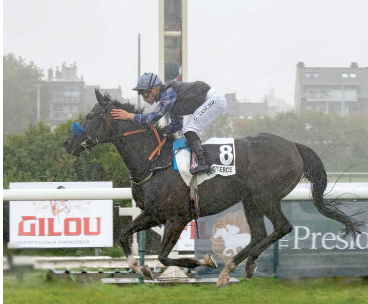
الفرس «ذايدة عذبة» حققت إنجازاً كبيراً في بلجيكا (الشرق الأوسط)

بطولة الأهمار السعودية الأصل والمنشأ والميدالية الذهبية، فيما توجت الفرس «منارة عذبة»، إنتاج «مررب عذبة»، ببطولة الأفراس السعودية الأصل والمنشأ والميدالية الذهبية. ونال الفحل «بلمس عذبة»، إنتاج «مررب عذبة»، بطولة الفحول السعودية الأصل والمنشأ والميدالية الذهبية. وحقق الفحل «فهد عذبة»، إنتاج «مررب عذبة»، فضية بطولة الفحول السعودية الأصل والمنشأ. وفي بطولة الأهمار عُمر سنة، حقق المهر «أكمل عذبة»، إنتاج «مررب عذبة»، بطولة الأهمار والميدالية الذهبية. وفي بطولة الفحول حقق الفحل «حاتم عذبة»، إنتاج «مررب عذبة»، بطولة الفحول والميدالية الذهبية، والعائدة جميعها للأمير عبد العزيز بن أحمد بن عبد العزيز.