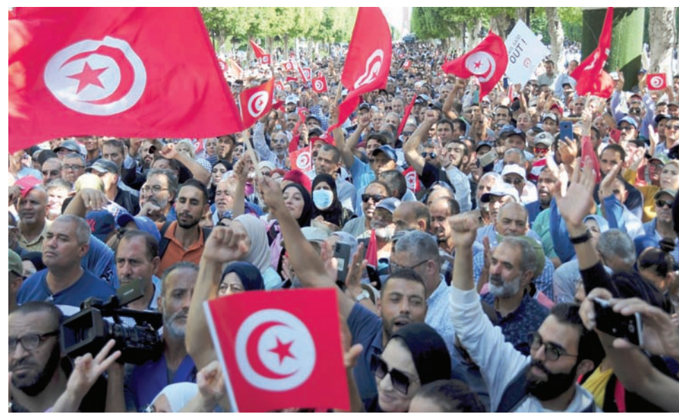
جانب من مظاهرة نظمها عاملون عن العمل وسط العاصمة للمطالبة بالتشغيل والتنمية

ووفق البيانات، التي نشرتها الوزارة، وأدى بها الوزير الزاهي، فإن تونس توجد بها أكثر من 980 ألف عائلة معوزة ومحدودة الدخل، تضم نحو 4 ملايين تونسي، من بين نحو 12 مليون نسمة. وكانت تونس قد وقعت في أبريل (نيسان) 2022 اتفاق قرض بقيمة 400 مليون دولار، وهو موجه