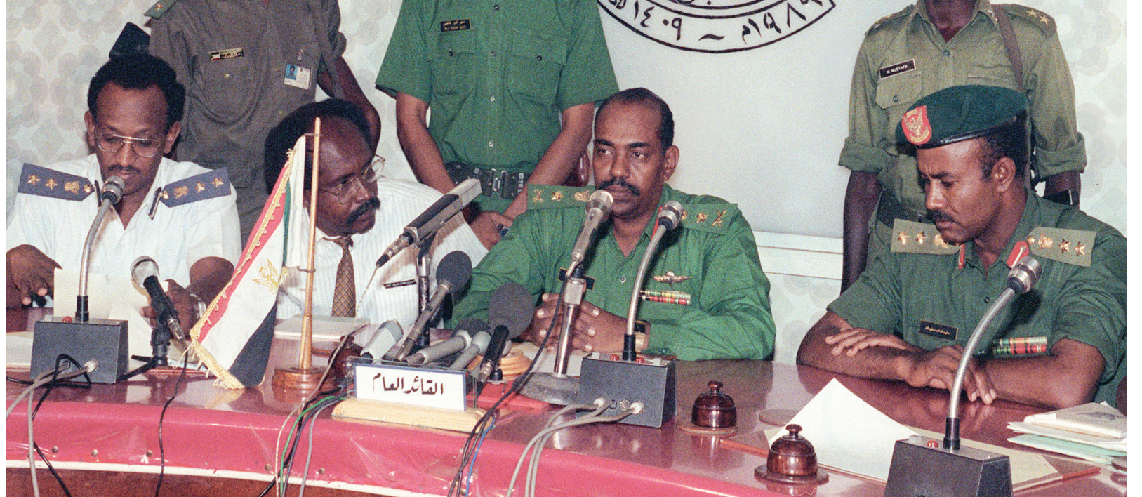
عمر البشير مع بعض أعضاء فرقة العسكري في الأيام الأولى لاستيلائه على السلطة عام 1989

بعد هروبهم من السجن أثناء حرب الجيش و«الدعم السريع»