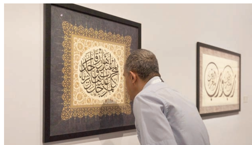
ترهوا جماليات الخط العربي في المعرض الذي تحتضنه الرياض (وزارة الثقافة)

المعرض والتجول بين حديقة من الأعمال واللوحات، للمسرحيين والفنانين وصلتهم الأثرية بهذا العنصر الثقافي المهم.