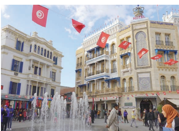
مارة أمام نافورة مياه في أحد ميادين تونس العاصمة

البرلمان، أشارت إلى أهمية هذا القرض في إنعاش الاقتصاد التونسي بعد أن شهدت عمليات تعبئة موارد مالية لموازنة الدولة نسفاً بطيئاً باعتبار تونس اتفاقاً جديداً مع صندوق النقد الدولي لمنحها تمويلات جديدة. وذكرت وزارة المالية التونسية أن إجراءات التفاوض والتعاقد حول القرض السعودي كانت ميسرة مقارنة بقروض دعم الموازنة من بقية المقرضين، سواء متعددة الأطراف والخنائية، مؤكدة أن سحب مبلغ القرض السعودي يتوقف على دخوله حيز التنفيذ فقط، في حين أن بقية القروض يستوجب سحبها المصادقة القانونية وتنفيذ الإصلاحات الاقتصادية الهيكلية المدرجة والتي تستغرق وقتاً طويلاً للاتفاق بشأنها وتنفيذها. يذكر أن إجمالي التعاون المالي بين المملكة العربية السعودية وتونس بلغ نحو 2,2 مليار دولار، وتجسد هذا التعاون في 49 مشروعاً هدفها دعم الاقتصاد التونسي.