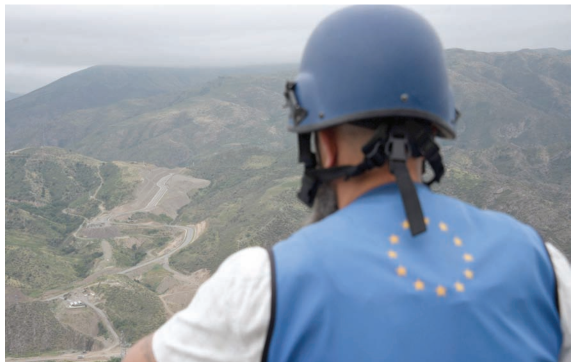
مراقب من الاتحاد الأوروبي ينظر في اتجاه مع «لاتشين» الرابطة البري الوحيد لمنطقة ناغورنو كاراباخ المنفصلة