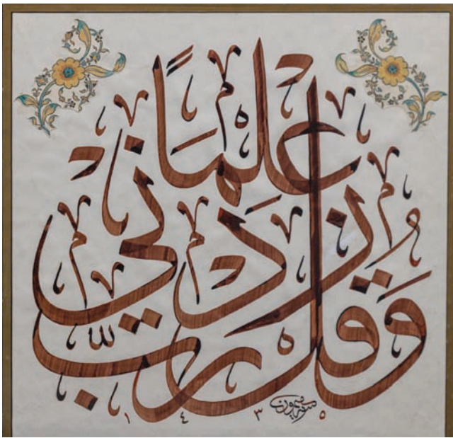
لوحة ناصر الميمون بخط الثلث الجلي في تكوين متصاعد وزخرفة باتجاه السماء

ترهوا جماليات الخط العربي في المعرض للإضاءة على البعد الروحي للخط في الحضارة العربية الإسلامية من خلال مجموعة أعمال فنية تاريخية وكلاسيكية ومعاصرة. المعرض الذي تتوزع موضوعاته على أربعة محاور متكاملة، هي: النور، والحرف، والمساحة، والشعر، يبحث عن القوة الروحية التي تغمر فكر الخطاط وتنعكس في تقنياته، وعلى العاطفة التي يخبرها الخط العربي لدى من يقرأ ويتأمله، بمشاركة واسعة لـ 34 خطاطاً من 11 دولة، و19 فناناً ومصمماً معاصراً من 12 دولة، من ضمنهم فنانون ومصممون سعوديون.