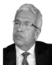
د. عبد المنعم سعيد

امتداد الإصلاح في الداخل إلى مجال السياسة الخارجية الإقليمية لا بد أن يأخذ أشكالاً إصلاحية كذلك بحيث يحقق الاستقرار الإقليمي، وترجمته هي البعد عن العنف والإرهاب والحروب الأهلية وجذب من يعيشون كذلك إلى دائرة الإصلاح أيضاً. ولعله سوف يكون مفيداً للغاية الاستفادة بما كان يطلبه الرئيس الأميركي باراك أوباما بأنه على الدولة ألا تقوم بأعمال «غبية». في واقعنا الحالي، فإن آخر الأزمات التي نمز بها تجسد في «الأزمة السودانية». وللحق، فإن الدول العربية الإصلاحية لم تآل جهداً من أجل إنقاذ السودان مما وصل إليه حاله، فتقدمت بالوعود المادي واستقبلت اللاجئين، وحاولت بصياغات شتى وقف إطلاق النار، وتعاونت السعودية مع الولايات المتحدة، ومصر مع دول الجوار الإقليمي؛ وقام الجميع بالاتصال بالفريقين المتحاربين، ومعهما ما سُمي بالقوى المدنية السودانية. وحتى وقت كتابة هذا المقال لم يكن كل هذا الجهد قد أثمر بعد، ولا يزال الحال في السودان الشقيق يتدهور على مدار الساعة، ويفقد العالم اهتمامه بالمأساة السودانية ففتراجع على سلم أولويات النظام الدولي، وكما كان يحدث من قديم الزمان في ما يتعلق بالنكبة الفلسطينية أن يرتفع الصوت الذي يتساءل لماذا لا يفعل «المجتمع الدولي شيئاً»؛ وهو سؤال مفوض؛ لأن قائله يعرف جيداً أنه لا يوجد ما يسمى «المجتمع الدولي» وإنما هي إرادات دول، وهذه الدول في هذه اللحظة مشغولة بأولويات أخرى أكثر أهمية.