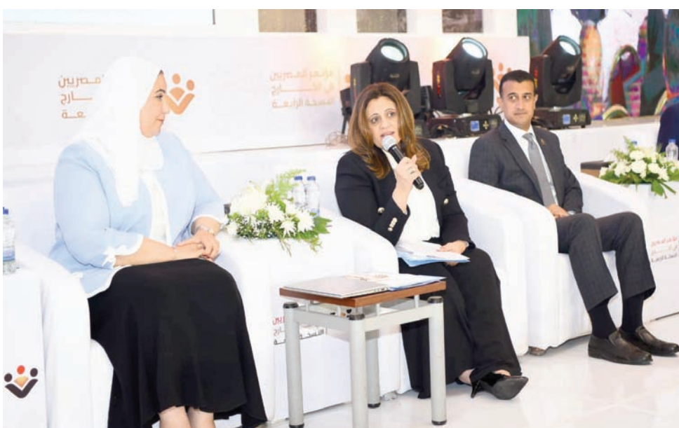
وزيرة الهجرة المصرية خلال مؤتمر المصريين بالخارج

وأضاف أستاذ الاقتصاد بجامعة السويس أهمية أن يتم التنسيق مع دول الخليج في إصدار الوثيقة التأمينية المقترحة، مشيراً إلى أن ذلك كان من شأنه أن «يوفر لها فرصاً أكبر في