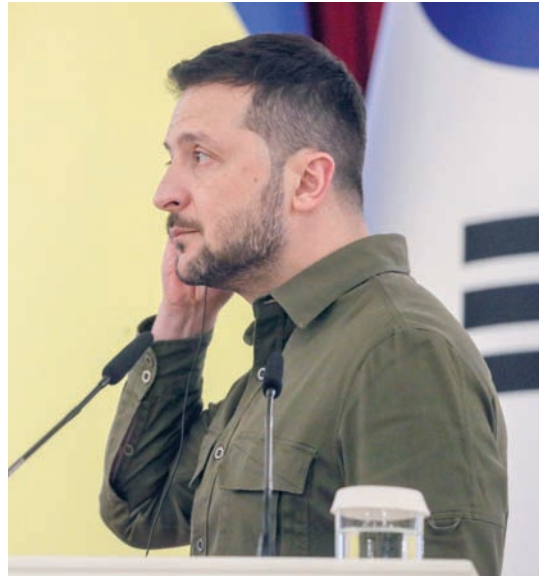
زيلينسكي حذر من حملة روسية لمنع قوات كييف من مواصلة هجومها

ستالين، ولكن إذا نسيت وارسو ذلك، فسوف تذكرها روسيا بذلك». وأوضح: «أود أيضاً أن أتذكر كيف انتهت هذه السياسة العدوانية لبولندا. وانتهت بالمأساة الوطنية لعام 1939، عندما ألقى الحلفاء الغربيون ببولندا من أجل التهام الآلة العسكرية الألمانية وفقدت بالفعل استقلالها ودولتها، التي تمت استعادتها إلى حد كبير بفضل الاتحاد السوفياتي».