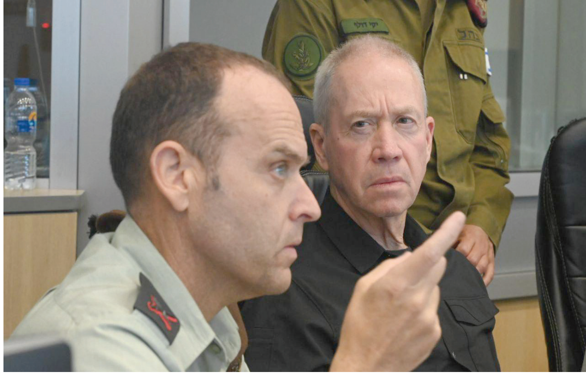
وزير الدفاع الإسرائيلي يوآف غالانت (يمين) في غرفة عمليات الجيش في 3 يوليو

ووفق «تاييمز أوف إسرائيل» وقّع على الرسالة 235 طياراً و98 طياراً نقل، 89 طيار مروحية، 173 مشغل طائرات مسيرة، 124 ضابطاً لمراقبة الحركة الجوية، 167 من العاملين في مقر سلاح الجو، 91 عضواً من طواقم التدريب، 80 عضواً من وحدة النخبة