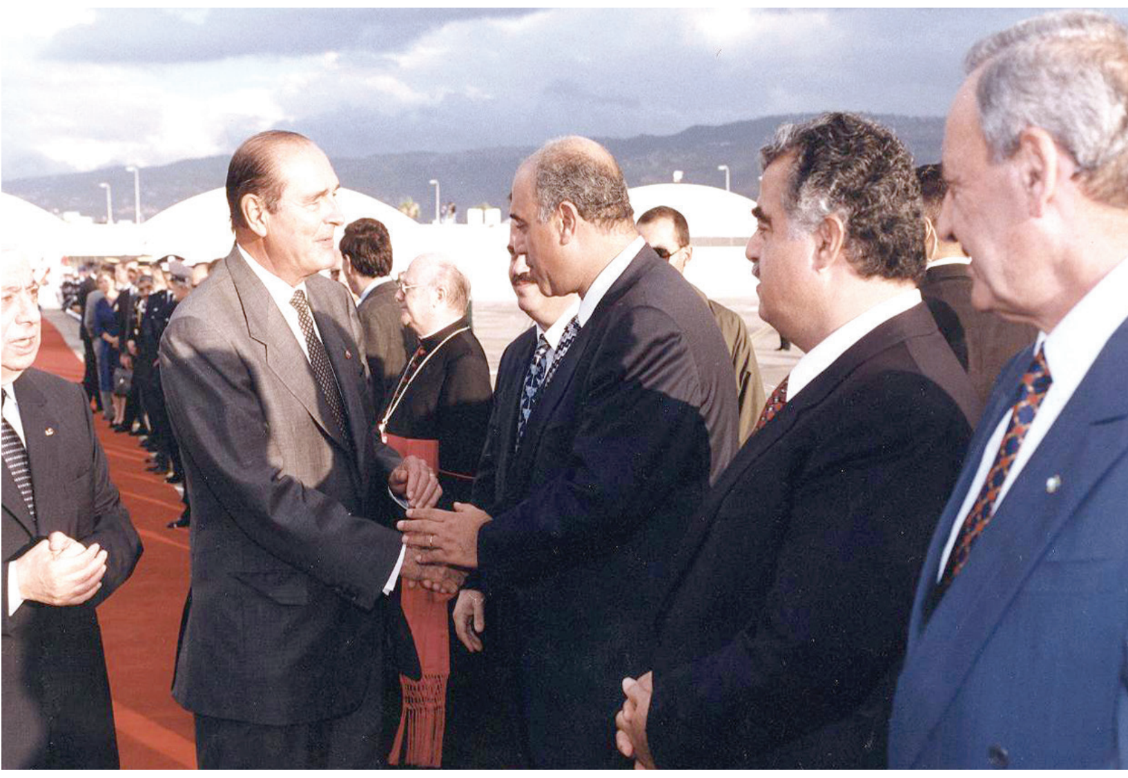
بوزن مستقبلاً الرئيس الفرنسي جاك شيراك في بيروت بحضور الرئيس الهراوي (يسار) والرئيس رفيق الحريري والرئيس نبيه بري