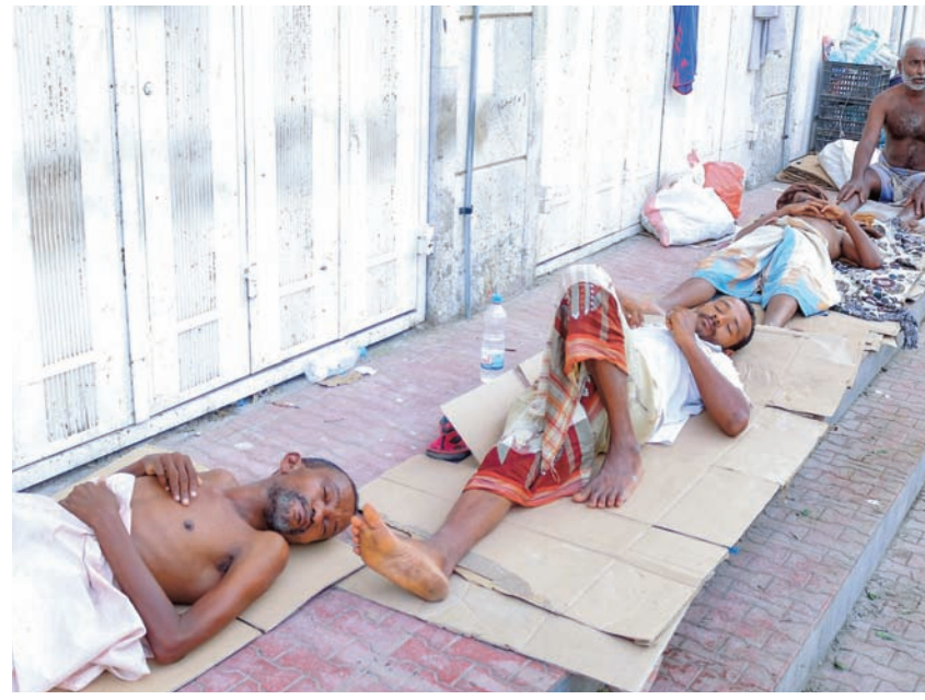
يقيمون نيامون على أحد أرصفة المدينة من شدة الحر داخل المنازل

سجل انخفاضاً قياسياً. وشهد العالم أكثر أيامه سخونة على الإطلاق في شهر يوليو (تموز)، ما حطم الرقم القياسي العالمي لدرجة الحرارة في عام 2016. تجاوز متوسط درجة الحرارة العالمية 17 درجة مئوية لأول مرة؛ إذ وصل إلى 17,08 درجة مئوية في 6 يوليو، وفقاً لخدمة مراقبة المناخ في الاتحاد الأوروبي (كوبرنيكوس). وتعد الانبعاثات المستمرة من حرق الوقود الأحفوري مثل النفط والفحم والغاز وراء اتجاه الاحتباس الحراري على كوكب الأرض. ظاهرة «النينيو» هي أقوى تقلبات مناخية تحدث بشكل طبيعي في العالم - ترتبط بجلب الماء الأكثر دفئاً إلى السطح في المحيط الهادي الاستوائي، ودفع الهواء