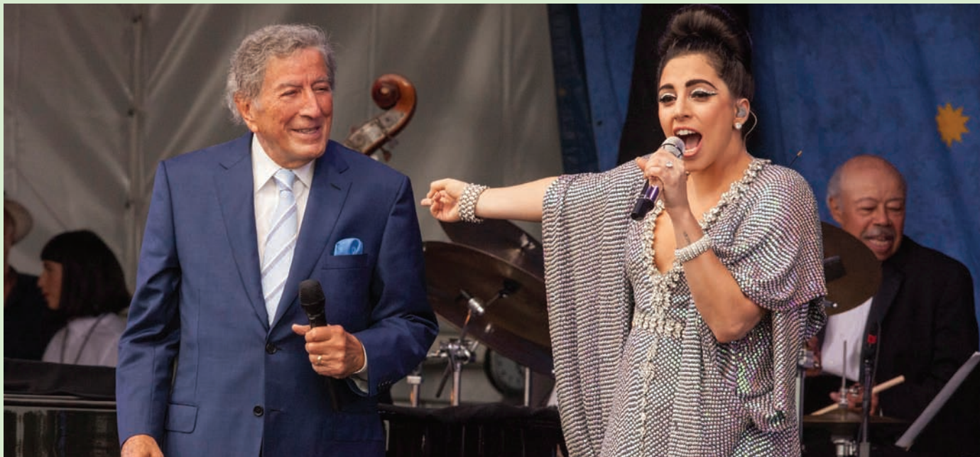
نيويورك، ليندسي زولادز *

لا يزال هذا واحداً من أكثر العروض الموسيقية إثارة للإعجاب التي رأيتها مباشرة - وفي سن 88 عاماً، لا أقل. في عام 2015، خلال العرض الثالث من أصل أربعة عروض بيعت بالكامل في قاعة «راديو سيتي ميوزيك»، كان توني بينيت وليدي غاغا يتشاركان في مشروع غنائي مشترك، وروجان لألبومهما الغنائي «تشيك تو تشيك»: وجنة إلى وجنة». كان لديهما تناغم خفيف وسريع في الأغاني التي أداها سويًا، ولكن أفضل أجزاء الألبوم كانت أغانيهم الفردية، وكل منهما يدعو جموع معجبيه - التقليديين الذواقين لدى بينيت والوحوش الصغيرة المهذبة ولكن المخصصة روحياً لدى غاغا - إلى عالم مختلف. خلال أغلب ساعات الحفل، كانا يعزفان مع فرقة موسيقية كاملة وأوركسترا، ولكن مع فرد واحد فقط خلال الأغاني الفردية الخاصة. استدعى بينيت عازفاً منفرداً على الغيتار للانضمام إليه في دائرة الضوء. وقال لنا إن الأغنية مهداة إلى صديقه المقرب، فرانك سيناترا». وشرع في حفل موسيقي رائع بالغنية «أذهب بي إلى القمر»، وحمل الميكروفون إلى جواره بدلاً من تقريبه من شفتيه. وبعد بضع خطوات، وضع الميكروفون على البيانو وأدى باقي الأغنية من دون أي توضيح للصوت على الإطلاق. ختم سكوت مطبق على القاعة بأسرها، وكان صوت بينيت قوياً وواضحاً للغاية لدرجة أنه يمكنك سماع كل نغمة بللورية، وكل نغمة معبرة، حتى في المقاعد الخلفية.