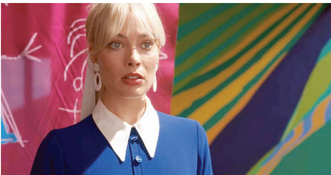
مارغوت روبي في «باربي»

برنامج من الذكاء الاصطناعي، سُمي في الفيلم Entity يستطيع أن يبيلور نفسه ليصبح حقيقة. لاحقاً ما يتبدى ذلك عبر سلسلة متعددة من الأحداث يعايشها هنت ما بين عالمين افتراضي وواقعي.