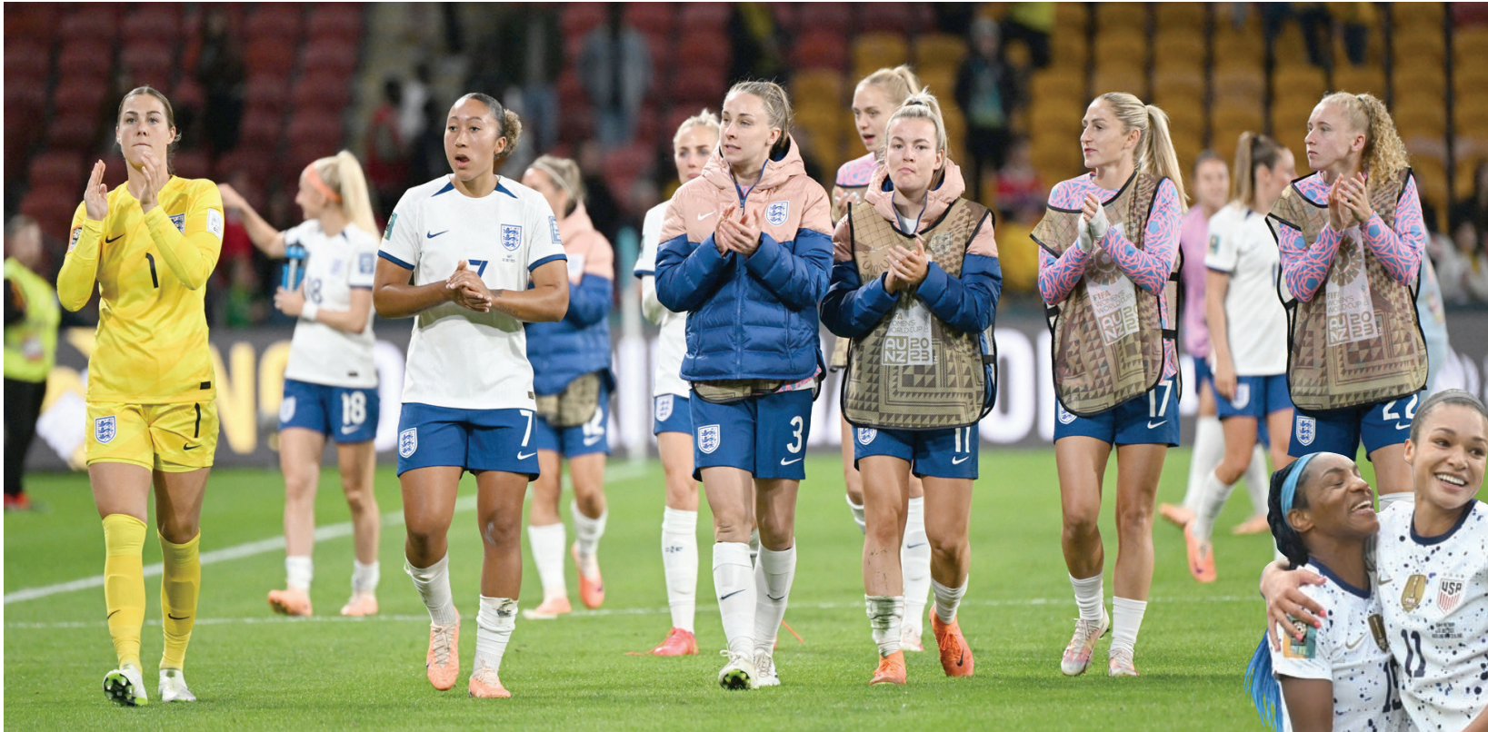
فرحة الإنجليزيات بالفوز الصعب على هايتي

وصمدت الآسيويات طويلاً أمام المنتخب الأمريكي قبل أن يحتسب الحكم ركلة جزاء لصالح الأخير انخرت لها مورغان لكن حارسة فيتنام كيم ترانه تهيأته ببراعة قبل نهاية الشوط الأول بدقيقة واحدة. وللمفارقة، احتسبت حتى الآن 8 ركلات جزاء في النهائيات اهدر منها أربع محاولات. بيد أن سميث أضافت الهدف الثاني في الدقيقة السابعة من الوقت بدل الضائع من هذا الشوط قبل أن تختتم