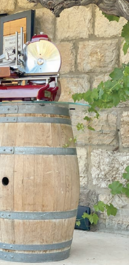
براي الشيف عقيقي أن الوقت وحده يؤلف بنية الشيف الناجح

كل هذه الخيوط توصلنا إلى خلاصة واحدة، وهي أنه يحب الطعام المؤلف من مكونات خام لا غش فيها، وهو ما دفعه إلى تسمية مطعمه «بروت» وتعني بالعربية «خام».