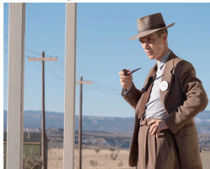
شيليان مورفي في «أوبنهايمر»

يتابع المخرج الغد نولان بطله برسم شبه محايد، فهو في نهاية المطاف يريد الحديث