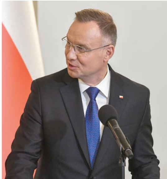
الرئيس البولندي دودا