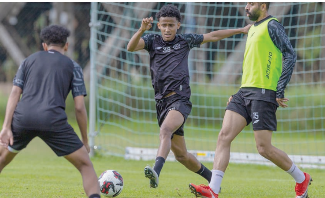
الشباب ما زال ينتظر دوره في مسرح التعاقدات الصيفي (نادي الشباب)