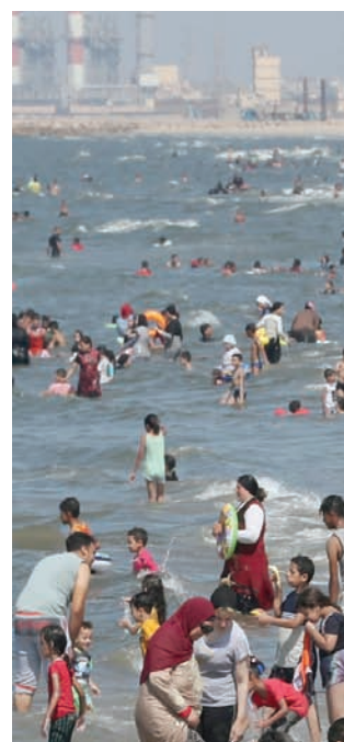
شاطئ مصري اكتظف بالهالبيين من حرارة الجو