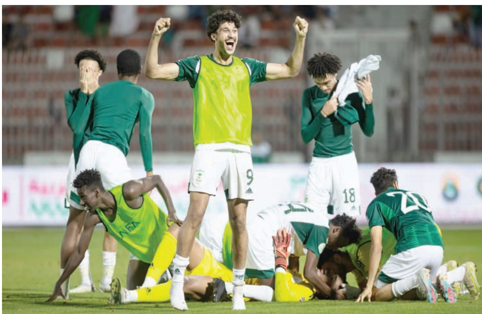
الكرة السعودية تتطلع لصناعة جيل أكثر ترمساً في المستقبل القريب (الشرق الأوسط)

فستشهد مشاركة 32 فريقاً، منهم 4 فرق سيصعدون إلى الممتاز، فيما سيشارك 16 فريقاً في الدوري المستحدث للدرجة الأولى لهذه الفئة.