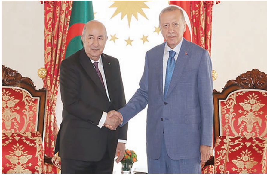
الرئيس إردوغان مستقبلاً تبون في قصر دوله بهشة

كما تعمل تركيا والجزائر على تعزيز التعاون في المجال العسكري، بما يعزّز القدرات الدفاعية للجزائر. لا سيما مع التطور الملحوظ في الصناعات العسكرية التركية، وخاصة في مجال الطائرات المسيرة. وفي 23 مايو (أيار) عام 2006، وقعت تركيا والجزائر معاهدة للتعاون والصداقة، أعطت دفعة قوية للتعاون بين البلدين في مختلف المجالات. ونصت المعاهدة، التي وقعها آنذاك الرئيس رجب طيب أردوغان عندما كان رئيساً لوزراء تركيا، والرئيس الجزائري الراحل عبد العزيز بوتفليقة، على تطوير الحوار في المجالات السياسية والاقتصادية والثقافية، والتزام الطرفين بتعزيز التعاون الاقتصادي، وخاصة في مجال المؤسسات الصغيرة والمتوسطة وعقد اجتماع سنوي رفيع المستوى بين البلدين.