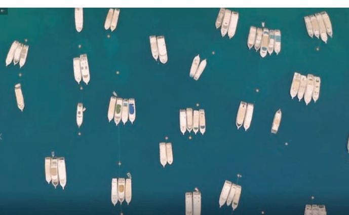
يخوت متعددة في أحد الموانئ المصرية (من فيديو ترويجي لوزارة النقل المصرية)

بالإضافة، وفق البيان، إلى أنه تم «تحديد تعريفية موحدة لرسم التراكي على جميع الأرصفة ومحطات الركاب والموانئ السياحية التابعة لوزارة النقل وبعملية واحدة لتفادي مشكلة تضارب رسوم التراكي الخاصة باليخوت الأجنبية مقابلات التراكي وتقديم الخدمات للمرايين السياحية الخاصة، وإطلاق الحرية لمرايين اليخوت الأجنبية في اختيار مكان الرسو للأسعار المعلنة والخدمات المقدمة والمظهر السياحي المطلوب زيارته، كما أنه يدخل من ضمن الإجراءات التي اتخذتها الحكومة المصرية لتعظيم سياحة اليخوت في مصر حالياً؛ وبيان بالإجراءات والموافقات الواجب اتخاذها لإنشاء مارينا دولية لاستقبال اليخوت الأجنبية مباشرة أو إنشاء مارينا محلية؛ وإدراج الجهات المعنية ومهامها