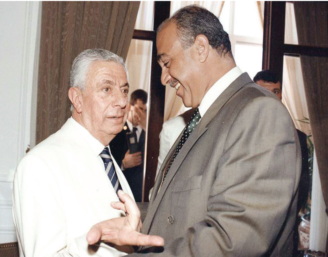
الرئيس اليباس الهراوي مع الوزير بوزن

والفاتيكان، - ترأس الوفد اللبناني لحل أزمة الشرق الأوسط في المؤتمر الذي عقد بمديريه سنة 1991. - شارك في اللقاءات الوزارية العربية والمؤتمرات الوزارية للدول المتوسطية والفرنكوفونية ودورات الأمم المتحدة وجامعة الدول العربية. - له عدة أبحاث ودراسات في قانون الشركات في الشرق الأوسط.