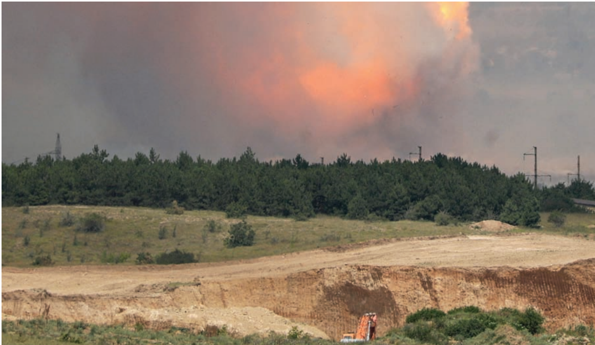
سحابة دخانية نتيجة انفجار في شبه جزيرة القرم

وقال زيلينسكي، كما نقلت عنه الصحافة الفرنسية، أن الهجوم المضاد لوقاته في طريقه لـ«كتساب زخم»، مُعداً جسر كيرتش هدفاً مشروعاً؛ لأنه طريق إمداد عسكري لروسيا. وقال زيلينسكي في كلمة عبر الفيديو أمام مؤتمر «أسبن» للأمم المتحدة، إن جسر القرم يجب أن يتم شل عمله، وعد أن الجسر يساهم في «تزويد شبه جزيرة القرم بالذخيرة». ويعد الجسر، الذي تم تشييده عام 2018، ممراً حيويًا لنقل الإمدادات إلى الجنود الروس الذين يقاوتون في أوكرانيا منذ بدء الغزو مطلع 2022. ويتألف من قسم طرقي وآخر للسكك الحديدية. وتُعد كيف الجسر منشأة «معادية» يخالف