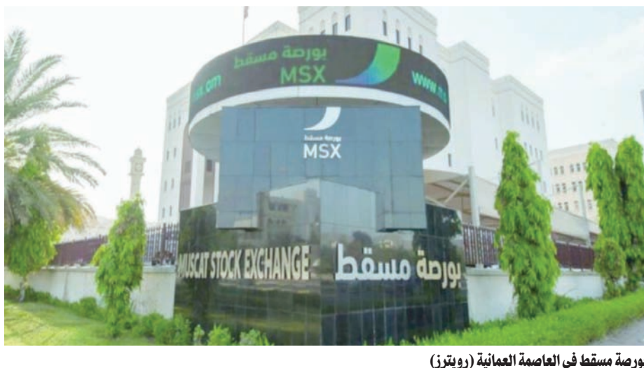
بورصة مسقط في العاصمة العمانية

وصعدت القيمة السوقية للبنوك بنهاية الشهر الماضي إلى 4 مليارات و702,3 مليون ريال عماني مقابل 4 مليارات و662,9 مليون ريال عماني في ديسمبر (كانون الأول) الماضي. واستحوذت البنوك بنهاية الشهر الماضي على 53,2 في المائة من إجمالي القيمة السوقية لشركات المساهمة العامة المدرجة في البورصة والبالغ 8,8 مليار ريال عماني.