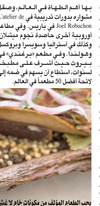
يحب الطعام المؤلف من مكونات خام لا غش فيها (الشرق الأوسط)

بها أهم الطهاة في العالم، وصقل مشواره بدورات تدريبية في L'atelier de Joel Robuchon في باريس. وفي مطاعم أوروبية أخرى حاصدة نجوم ميشلان، وكذلك في أستراليا وسويسرا وبروكسل وهولندا، وفي مطعم «برغندي» في بيروت حيث أشرف على مطبخه لسنوات، استطاع أن يسهم في ضمه إلى لأتحة أفضل 50 مطعمًا في العالم.