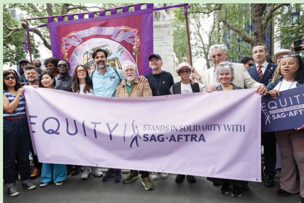
الممثلان براين كوكس وساميون بيغ يتوسطان تجمعاً أمام لافتة نقابة الممثلين البريطانيين «إيكويتي»