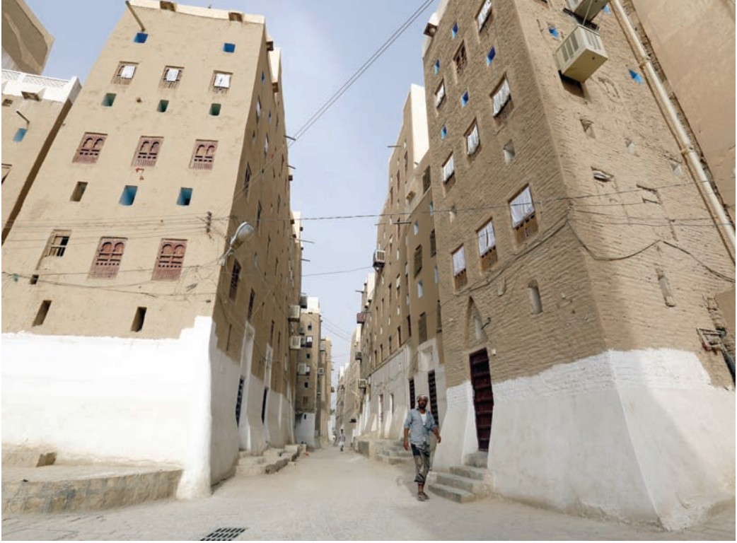
ناطحات سحاب مبنية من الطين في مدينة شيام اليمنية القديمة المسورة في محافظة حضرموت

في السعي للحدّ من الانبعاثات الكربونية، تفرض السياسات العالمية الجديدة البحث عن أساليب بناء مستدامة توفّر الخبرات المتوارثة محلياً بكلفة قليلة. وعلى سبيل المثال، أطلقت إدارة الرئيس الأميركي جو بايدن مبادرة جديدة لتقليل الانبعاثات عبر توجيه الوكالات الفيدرالية لشراء مواد بناء ذات انبعاثات أقل، وتشجيع الولايات والحكومات المحلية على فعل الشيء نفسه في الأبنية المدعومة فيديالياً. ومؤخراً، أضافت اليابان متطلبات العزل وخفض استهلاك الطاقة إلى برنامج الرهن العقاري الحكومي، بحيث تخطى المنازل القليلة الانبعاثات بأسعار فائدة منخفضة. وتوسّع توظيف الخبرات والموارد المحلية في مواجهة تغيّر المناخ عمرانياً، ليشمل أيضاً المرافق العامة والتخطيط الحضري. ففي فرنسا، التي تواجه موجات حر متعاقبة منذ سنوات، جرى تبني برنامج لتحويل 761 مدرسة في باريس إلى جزر خضراء للمساعدة في التخفيف من ظاهرة جزر الحرارة الحضرية الناتجة عن انتشار الأبنية القائمة ضمن المدن. وفي جنوب أفريقيا، يتسبب اعتماد مدينة كيب تاون على الهطولات المطرية لتأمين المياه العذبة في حدود حالات جفاف كارثية، ونتيجة لذلك يجري استبدال أنواع محلية بدلية أكثر تحملاً للجفاف بالبروج والنباتات المعمّرون أساليب العمارة