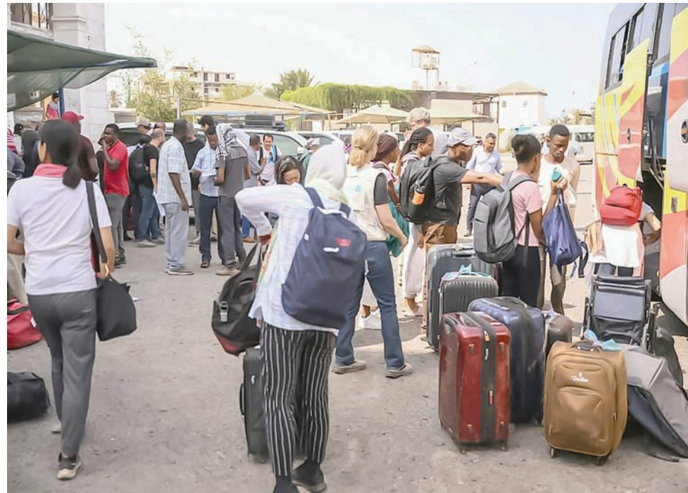
سودانيون وأجناب هاربون من المعارك في العاصمة الخرطوم