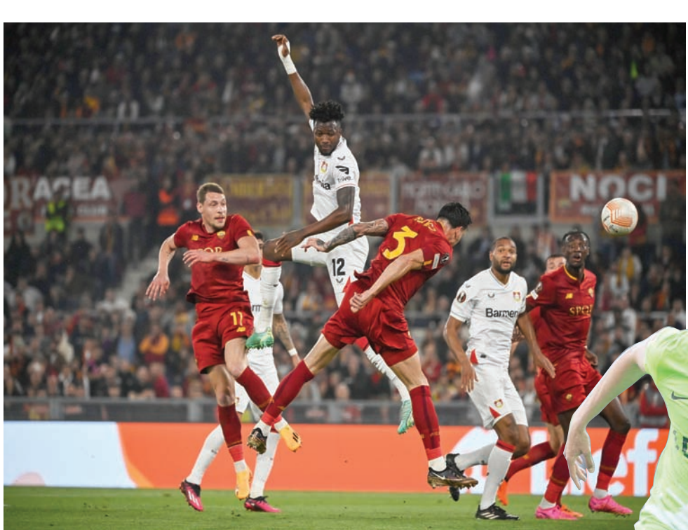
نجم باير ليفركوزن إدموند تابوسا (الثالث من اليسار) في مواجهة روما في الدوري الأوروبي

فيها بشكل أكبر. وبالنسبة لها، يساعدها برشلونة بشكل كبير على تحقيق أهدافها. وتقول: «برشلونة يستمر كثيراً من الأموال في كرة القدم للسيدات. وأعتقد أنه يتعين على الأندية في البرازيل أن تأخذ برشلونة وليون واكبر الأندية في العالم، مثلاً يحتذى به. بالنسبة لي، أعتقد أن برشلونة هو أفضل فريق خارج البرازيل، أما داخل البرازيل فاعتقد أن كورينثيانز هو الأفضل. لذلك أعتقد أن الأندية في البرازيل يجب أن تتنظر