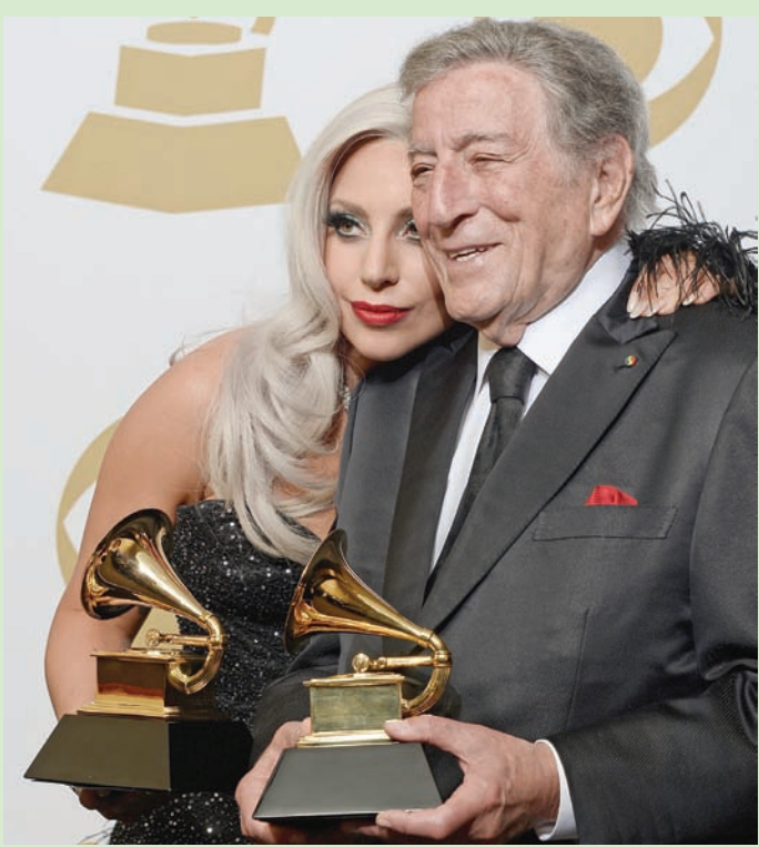
توني بينيت وليدي غاغا... ثنائي غنائي غير متوقع

ليت غاغا رغبة بينيت في البقاء نشطة والمشاركة مع جيل أصغر سناً من الموسيقيين، وجعلها استقرارها المهني أكثر الشركاء التزاماً في الثنائي. لكن غاغا قالت أيضاً إن إرشادات بينيت «أنقذت» حياتها الفنية. وقد سمح لها مثال الثمانينيات آنذاك بالتفكير لما وراء نجاحات أو إخفاقات اللحظة الراهنة، وتقدير طول العمر الذي تستغرقه مهنة الموسيقى. تقول ليدي غاغا عن الفترة