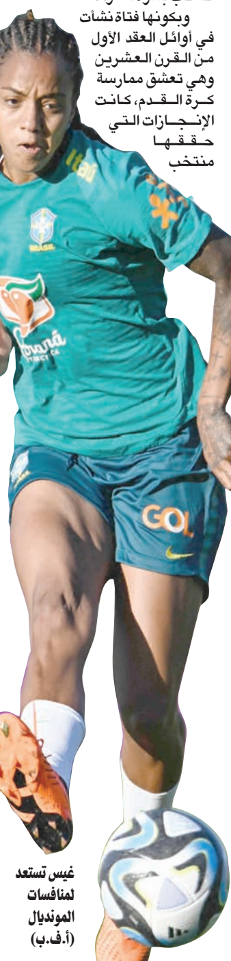
غيس تستعد لمنافسات المونديال (أ.ف.ب)

لم يكن ذلك مفاجئاً على الإطلاق، لأن فان دي فين كان أسرع مدافع في الدوري الألماني الموسم الماضي. واليالنظر إلى أن بوسيتيغولو يريد من مدافعيه أن يتحلوا بالجماعة، فمن الجيد أن يكون لديه لاعب سريع للغاية مثل فان دي فين لديه القدرة على تصحيح أي خطأ يرتكبه الفريق. لكن يجب الإشارة إلى أن كلا المدافعين لديه عيوب فيما يتعلق بالعباء الهواء. فعلى الرغم من أن فان دي فين فارع الطول - 1,93 متر - فإن معدل نجاحه