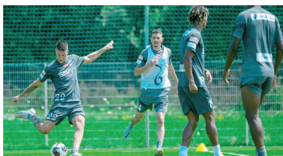
الهلال يأمل إتمام كامل متطلبات الشهادة لتسجيل لاعبيه الجدد (نادي الهلال)

سلمان أو الدوري، لذلك فإنه سيعمل أولاً على استخراج شهادة الكفاءة، وبعدها يشارك لاعبيه الجدد في المباريات. هذا، وتشمل بنود شهادة الكفاءة المالية جميع أنشطة النادي، ويجب أن تسدد الرواتب حتى نهاية شهر أبريل من العام 2023، حتى يحصل كل فريق على الشهادة ويتمكن من تسجيل لاعبيه الجدد، وتعاقداته خلال الميركاتو الصيفي الحالي، وذلك قبل بدء منافسات الموسم الكروي الجديد بشكل رسمي وقانوني، بناء على الاشتراطات المعلنة من جانب وزارة الرياضة في أبريل الماضي.