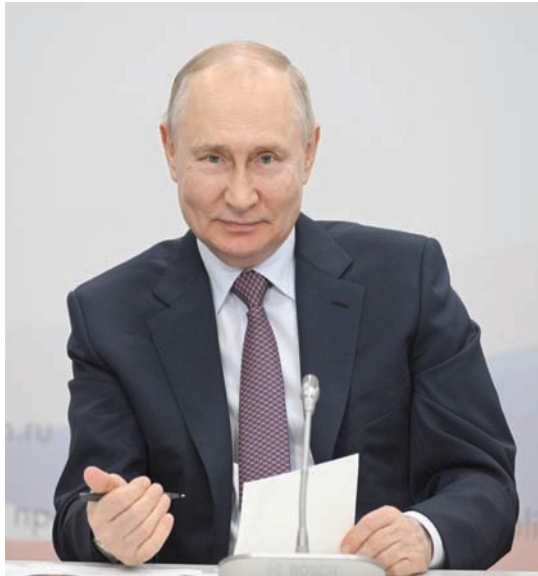
بوتين يتهم بولندا وليتوانيا بتأجيل الصراع لمصلحتها

زيلينسكي حذر من حملة روسية لمنع قوات كييف من مواصلة هجومها