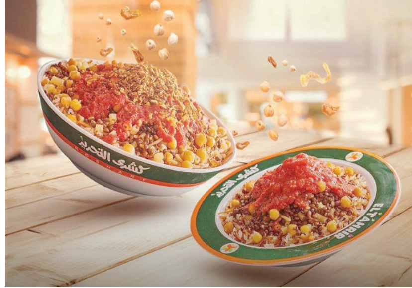
«كشري التحرير»، من أشهر المطاعم في القاهرة

ديكور المطعم بسيط جداً، ويرتكز على أسلوب الأكل السريع أو الـ Fast Food، ويمكن الجلوس إلى طاولات عادية أو إلى طاولات عالية، ويقدم المطعم الكشري في أطباق بلاستيكية تحمل اسم المطعم، أما