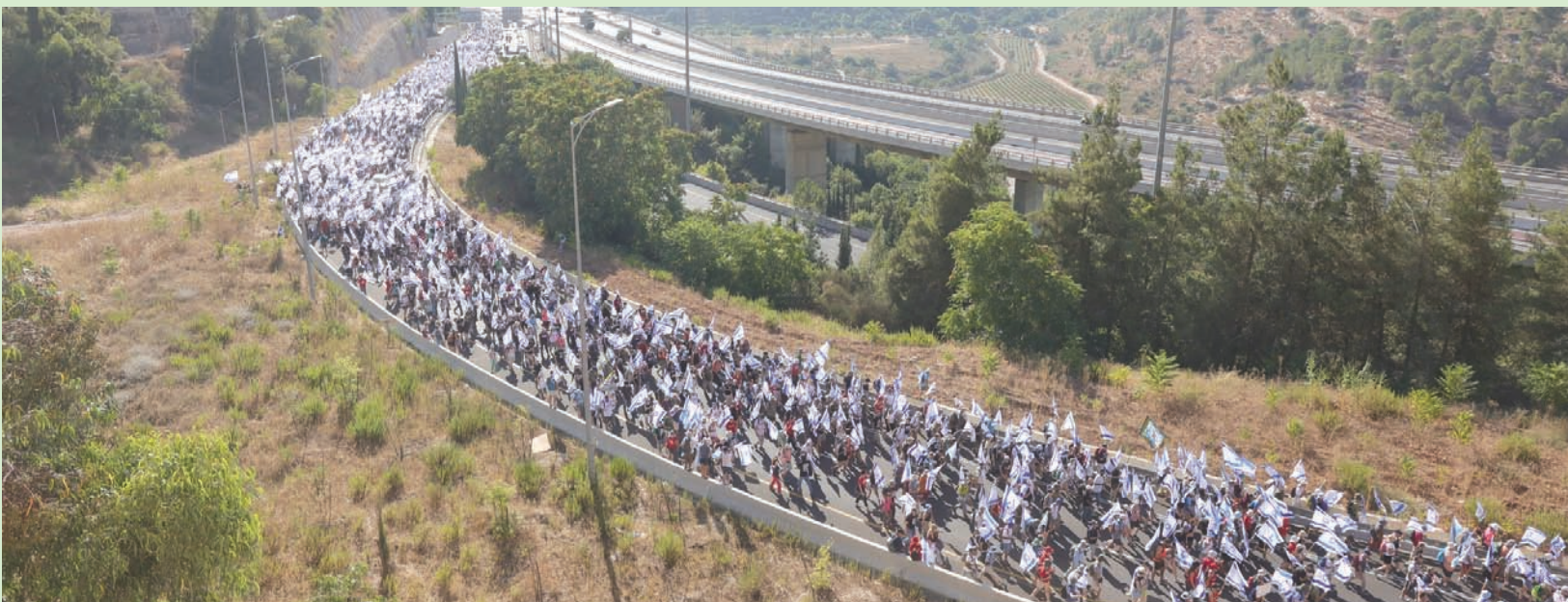
مسيرة إسرائيلية حاشدة صوب القدس أمس للاحتجاج ضد خطة الحكومة لتعديل النظام القضائي

وأصدر مكتب غالانت بياناً قال فيه إنه يعمل بشتى الطرق للتوصل إلى توافق واسع، بهدف منع الإضرار بأمن إسرائيل وإبعاد الجيش وتركه بعيداً عن الخلاف السياسي. وجاء تحرك غالانت مع توقيع مزيد من جنود الاحتياط في سلاح الجو الإسرائيلي بيانات أعلنوا فيها أنهم لن يلتزموا مواصلة التطوع في الجيش.