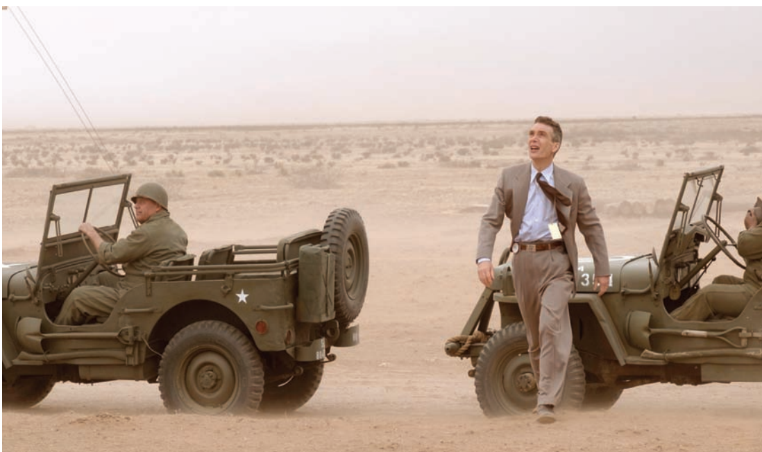
مشهد من «أوبنهايمر»