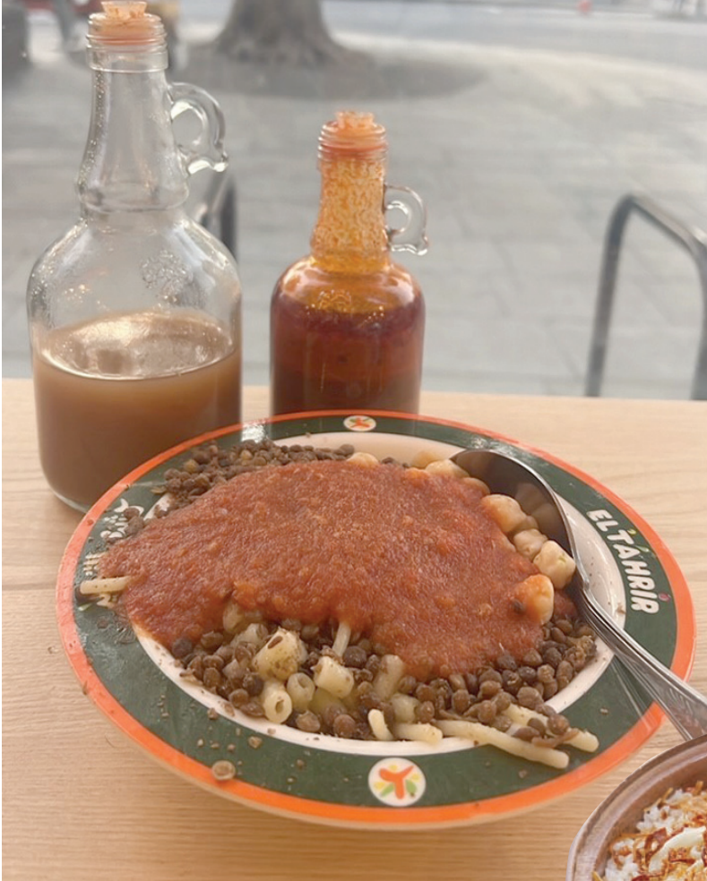
الحجم الصغير لطبق الكشري في لندن

للکشري نكهته الخاصة فهو «مهرجان» كامل متكامل من الكربوهيدرات