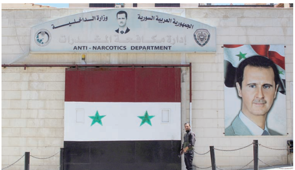
صورة الرئيس بشار الأسد على مقر أمن في دمشق بتاريخ 14 يونيو الماضي

بعد أن تبكت القوات السورية من السيطرة على الغوطة الشرقية وأشهر مدنها دوما، غاب علوش عن النظر منتقلاً إلى تركيا ليظهر على الأراضي الفرنسية وتحديداً في مرسيليا طالباً في أحد معاهدتها، وذلك بفضل منحة تسمى «إيرسموس» لتبادل الطلاب وبثايشرة طالب. إلا أن القوى الأمنية ألقت القبض عليه يوم 29 يناير (كانون الثاني) عام 2020. وبعد يومين فقط من توقيفه، وجه إليه القضاء الفرنسي تهمة ارتكاب جرائم حرب وتغيب والتواطؤ في حالات اختفاء قسري، حيث إن «جيش