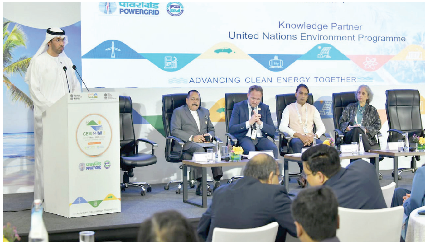
الجابري يلقي كلمته خلال جلسة حوارية حول أنظمة التبريد المستدام ضمن فعاليات اجتماع مجموعة العشرين (وام)

دعا وزير الصناعة والتكنولوجيا المتقدمة الرئيس المعين لمؤتمر الأطراف (كوب 28) سلطان الجابر، جميع الدول للانضمام إلى «تعهد التبريد العالمي»، وهو شراكة بين برنامج الأمم المتحدة للبيئة ورئاسة مؤتمر الأطراف، تم الإعلان عنها في وقت سابق من العام الحالي.