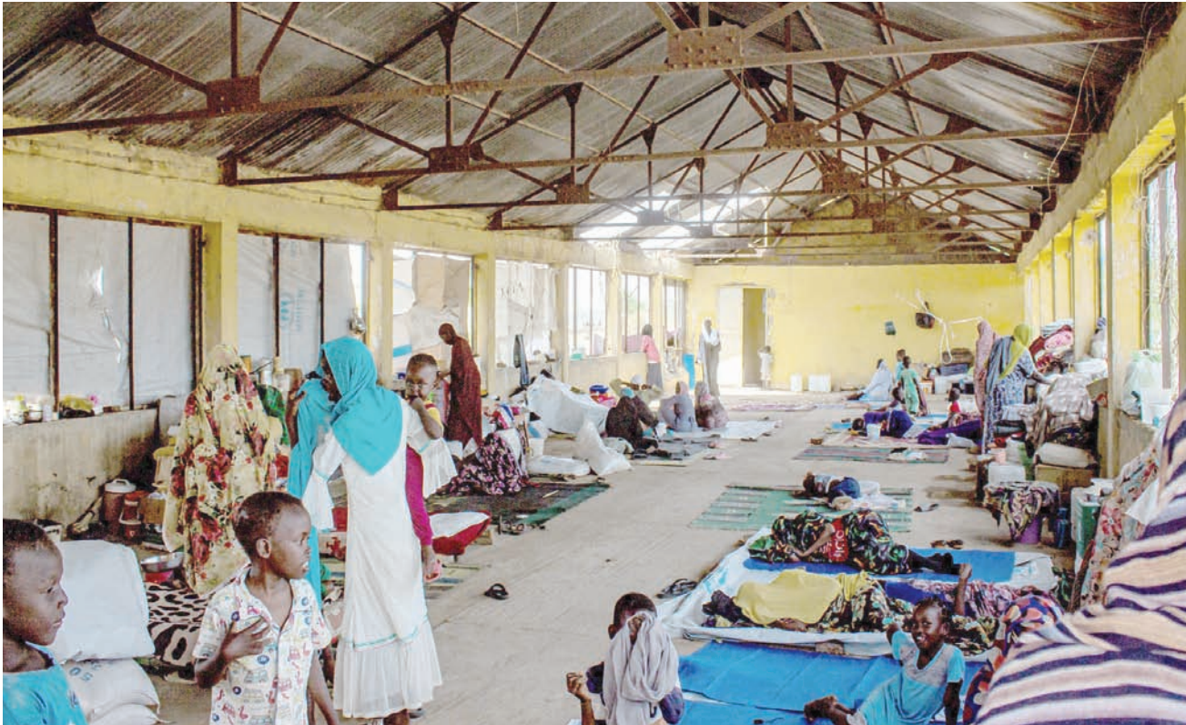
نازحون من الخرطوم لجأوا إلى مدينة وود مدني القريبة (أ.ف.ب)

صبيحة 15 أبريل (نيسان)، فوجي المواطنون بإطلاق نار كثيف