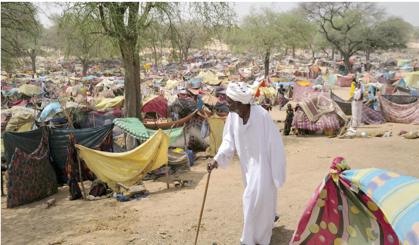
سودانيون فروا من القتال بدارفور في منطقة حدودية بين السودان وتشاد في 13 مايو 2023 (أ.ف.ب)

وتقول «منظمة الهجرة الدولية» (IOM) في آخر تقرير لها، إن مليونين و613 ألف شخص معظمهم من الخرطوم ودارفور، نزحوا إلى أماكن أخرى داخل البلاد، فيما لجأ 757 ألفاً و230 شخصاً آخرين إلى دول الجوار: مصر، وليبيا، وتشاد، وأفريقيا الوسطى، وجنوب السودان. وقد توجه 33 بالمائة منهم إلى مصر، بينما لجأ 31 بالمائة إلى تشاد، و23 بالمائة إلى جمهورية جنوب السودان.