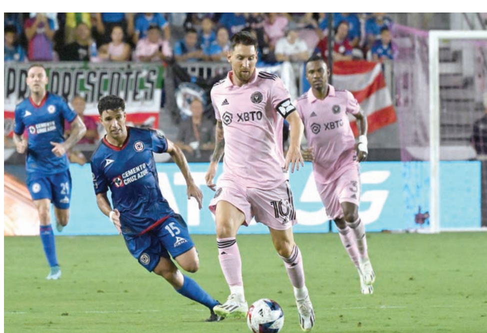
ميسي قائد إنتر ميامي إلى تحقيق فوز صعب على مضيئه كروز أزول

ويخوض إنتر ميامي مباراته الثانية ضمن هذه المسابقة ضد أتلانتا الثلاثاء المقبل. وتضم هذه المسابقة التي تم استحداثها عام 2019، 29 فريقاً من الدوري الأمريكي و18 من الدوري المكسيكي وزعت على 15 مجموعة تضم كل واحدة 3 فرق. ولم يكن ميسي قد خاض أي مباراة منذ مشاركته الأخيرة في صفوف فريقه السابق باريس سان جيرمان به. وتابع: «إنه أمر مثير للغاية بالنسبة إلى أنصارتنا، إلى جميع هؤلاء الذين قدموا إلى هنا لرؤية ميسي. إنه حلم يتحقق للجميع لرؤية ما حدث في الملعب».