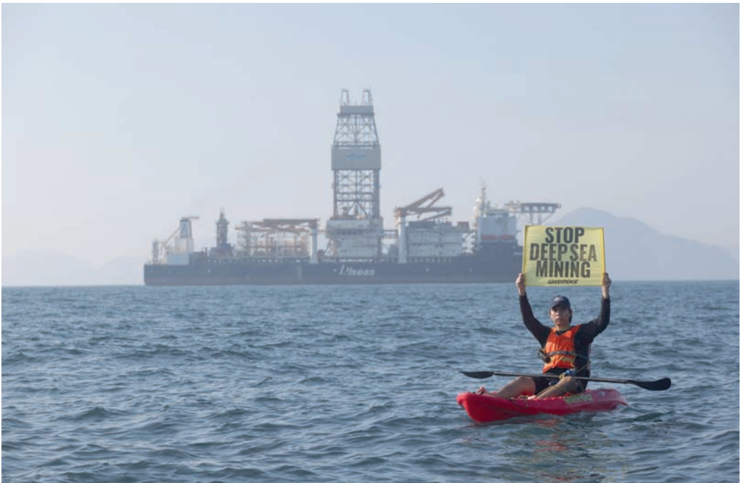
ناشط من منظمة «غرينبيس» يحمل لافتة احتجاجية تندد بالتعدين في أعماق البحار

وفي عام 1994 تأسست «الهيئة الدولية لفاع البحار»، بموجب اتفاق أممي تحت مظلة اتفاقية الأمم المتحدة لقانون البحار. وتمثّل المهمة الأساسية للهيئة في تنظيم استكشاف واستغلال المعادن في قاع البحر العميق خارج حدود الجرف القاري والمناطق الاقتصادية الخالصة للدول. وبموجب هذا التعريف تشمل وصاية الهيئة ما يزيد