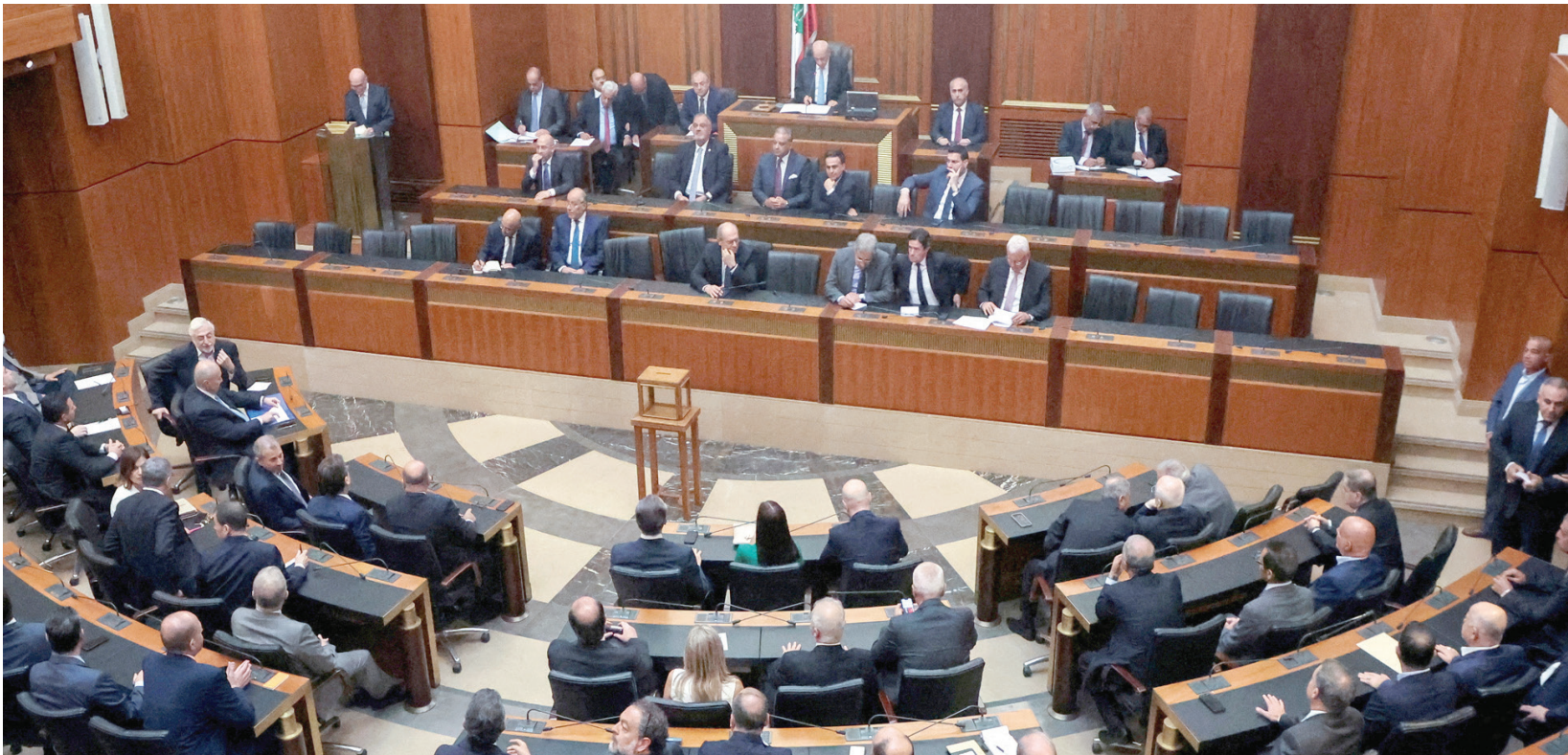
مجلس النواب يفشل مجدداً في انتخاب رئيس للجمهورية (رويترز)

وترجح المصادر أن تكون ورقة فرنجية وأزور قد احترقتا حتى حينه، لتتقدم حظوظ مرشح ثالث إما أن يكون قائد الجيش جوزيف عون، أو أن يكون مرشحاً وسطياً كالوزير السابق زياد بارود، والوزير السابق ناجي البستاني، والوزير السابق ناصيف حني، أو سواهم.