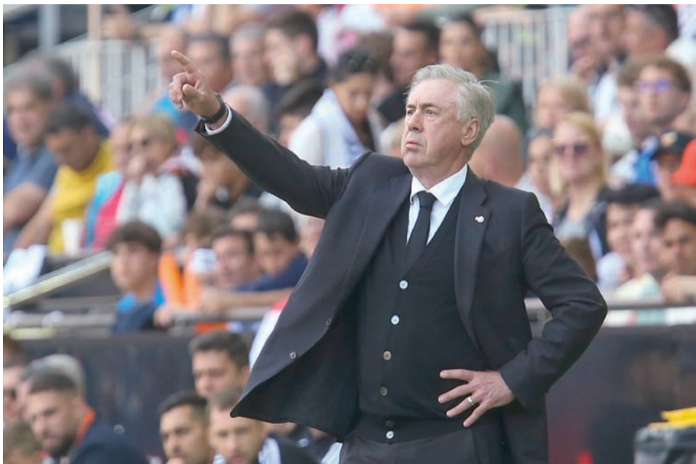
أنشيلوتي المدير الفني المنتظر لمنتخب البرازيل

أثار الحل الذي تم التوصل إليه بتعيين فيرناندو دينيز مدرباً لمنتخب البرازيل لكرة القدم، بانتظار وصول المدرب الإيطالي كارلو أنشيلوتي، المدججة سيرته الذاتية بالألقاب، تساؤلات وانتقادات من طرف وسائل الإعلام البرازيلية، بما أن دينيز سيشغل منصب مدرب المنتخب، وفريق فلومينينسي المرتبط معه بعقد حتى نهاية عام 2024. وانتقد الرئيس البرازيلي لويز إيناسيو لولا دا سيلفا اختيار أنشيلوتي لتدريب المنتخب البرازيلي. وأعلن إرنالدو رودريغز، رئيس الاتحاد البرازيلي لكرة القدم، قبل أيام، أن كارلو أنشيلوتي، المدير الفني لفريق ريال مدريد الإسباني، سيتولى تدريب المنتخب البرازيلي في صيف عام 2024 قبل بطولة كوبا أمريكا التي تنظم العام المقبل في الولايات المتحدة، وقدم الاتحاد البرازيلي فيرناندو دينيز يوم الثلاثاء الماضي كمدرب مؤقت لمنتخب