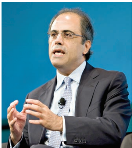
جهاد أزور