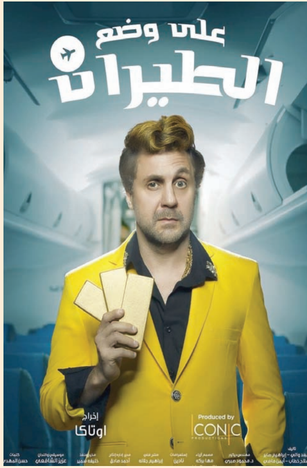
بوستر مسرحية «على وضع الطيران»

وبسؤاله عن إمكانية تقديم موسم خامس من المسلسل في عام 2024، قال: «حتى تلك اللحظة، لا توجد أي أفكار، أو مناقشات حول تقديم موسم خامس، لكن لو رغب الجمهور في مشاهدة جزء جديد