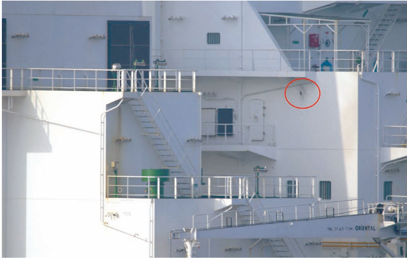
جانب من الأضرار في الناقلة «ريتشمووند فوياجر» بعد تعرضها لإطلاق نار من قبل البحرية الإيرانية

وأعلنت إيران، الخميس، أن قواتها سعت لإعتراض ناقلة نفط، قالت إنها اصطدمت بسفينة إيرانية، بعد اتهام البحرية الأميركية لطهران بمحاولة احتجاز السفينة، ونقلت وكالة «إرنا» الرسمية في إيران عن «هيئة الموانئ والملاحة البحرية الإيرانية» قولها إن ناقلة النفط «ريتشمووند فوياجر» التي ترفع علم جزر البهاما اصطدمت بسفينة إيرانية، وتسببت بإصابات خطيرة لـ 5 أفراد طاقمها. وبحسب البيان، فإنه بعد هذا الاصطدام، واصلت ناقلة النفط (ريتشمووند فوياجر) طريقها، بغض النظر عن القواعد والأنظمة البحرية الدولية». وأكدت «هيئة الموانئ والملاحة البحرية» أن صاحب السفينة الإيرانية طلب «الحجز الفوري» على الناقلة المخالفة بالرجوع إلى السلطات القضائية. وذكرت «إرنا» أنه تم التعرف «صباح الأربعاء» على ناقلة النفط المخالفة، وقد تجاهلت تحذيرات سفينة القوات البحرية الإيرانية، مؤكدة أنها دخلت المياه الإقليمية لسلطنة عمان. وأضافت الوكالة أنه «تم إبلاغ سلطنة عمان الصديقة» بذلك، مشيرة إلى