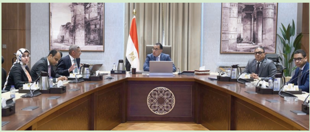
مدبولي خلال لقاء الرئيس التنفيذي لوكالة الفضاء المصرية، الثلاثاء الماضي (الحكومة المصرية)

عمل المركز». وأضاف أن «الجانب الألماني ساهم في عملية توريد الأنظمة الفرعية للقمر الاصطناعي، أما الجانب المصري فتولى