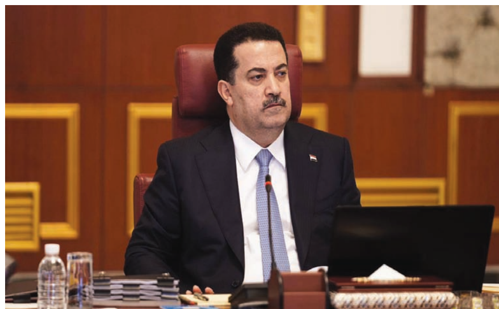
السوداني يترأس اجتماعاً للحكومة العراقية

وأضافت أنه «جرى طبقاً لذلك الإجراءات تفكيك شبكة تهريب النفط في البصرة وميسان والإطاحة بكبار المسؤولين عليها، والقبض على رئيس هيئة استعمار ذي قار السابق لإضراره بالمال العام بأكثر من مليار دينار». كما بينت أنه «صدر الحكم على وزير النقل الأسبق بالحبس الشديد، وكذلك لدبري بلديات وصحة بابل الأسبقين». ومن بين ما تم تحقيقه في محافظات ومناطق خارج الأنبار «ضبط اختلاسات 26 صكاً بقيمة 292 مليون دينار بالمنح العقارية لشهداء واسط، وإيقاف صرف 60 مليار دينار لأحد المشروعات المنفذة بكرةلاء، والقبض على مدير المصرف العقاري بالديوانية لإخلائه 5 مليارات دينار، واستقدام مدير عام تربية ميسان وموظفين آخرين لاستغلالهم على أكثر من 17 مليار دينار، فضلاً عن إجراءات