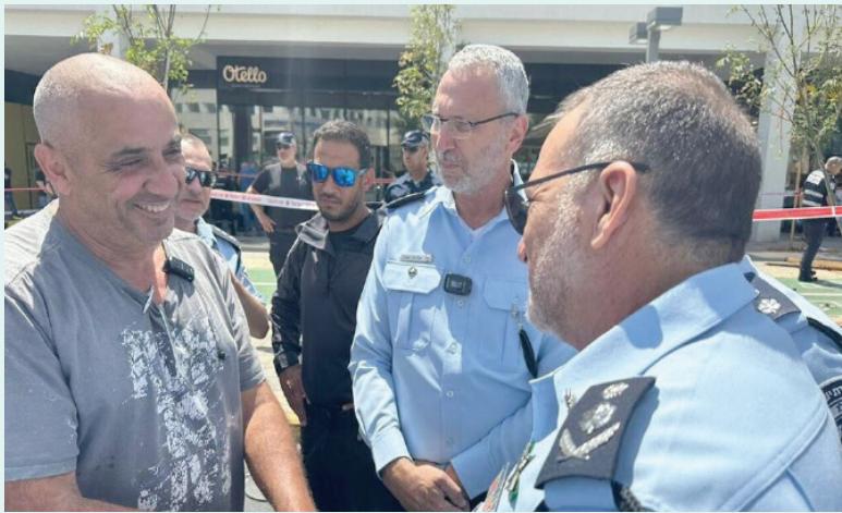
يكوتهيل (الأول من اليسار) لدى لقائه مفتش الشرطة العام شبتاي (الشرطة الإسرائيلية)

وكانت جهات فلسطينية غير معروفة، ظهرت باسم «حركة فوضى فلسطين»، نشرت شريطاً تقول فيه إنها حصلت على تفاصيل الإرهابي الصهيوني الذي أطلق الرصاص على الشهيد حسين خلايلة في تل أبيب، ونشرت اسمه وصورته، وأصدر بيته وزوجته وأولاده، وكتبت: «لأن أصبح كل شيء جاهزاً، هيا يك ما هو قاتل أخيكم الشهيد. هياو للثار لدماثة»، وكان خلايلة وصل إلى تل أبيب، بعد الاجتياح الإسرائيلي لمخيم جنين، الثلاثاء الماضي، وهو يقود سيارة إسرائيلية حصل عليها من مكان عمله في ورشة بناء. وهدس بالسيارة مجموعة أشخاص على محطة باصات، ثم نزل من السيارة وراح يطعن المارة بسكين، وأصاب تسعة منهم بجراح، لا يزال خمسة منهم يتلقون العلاج في المستشفى. وقد كان يكوتهيل في المكان فاستل مسدسه وأطلق الرصاص عليه حتى سقط أرضاً. وحسبما ظهر في اشرة فيديو عديدة