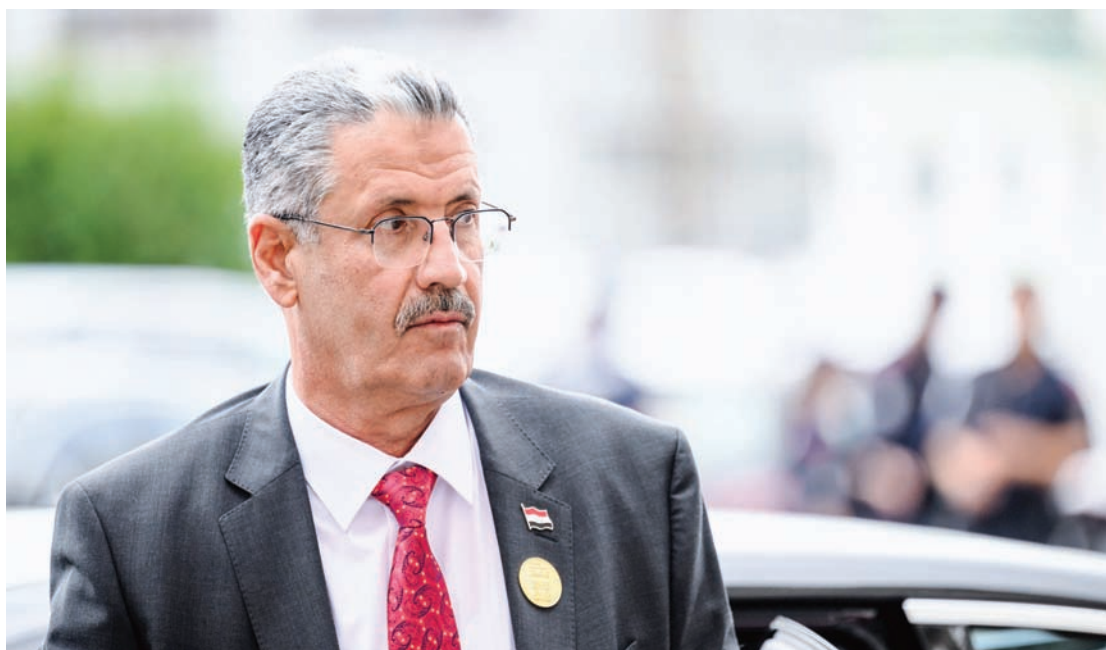
وزير النفط العراقي حيان عبد الغني

الأميركيين الذين قدموا طلبات جديدة للحصول على إعلانات المطالة سجل زيادة متوسطة الأسبوع الماضي، في حين قفز عدد الوظائف في القطاع الخاص في يونيو (حزيران)، مما يزيد من احتمال رفع مجلس الاحتياطي سعر الفائدة هذا الشهر. وتؤدي أسعار الفائدة المرتفعة إلى زيادة تكاليف الاقتراض بالنسبة للشركات والمستهلكين، مما قد يبطئ النمو الاقتصادي ويقلل الطلب على النفط. ورجحت مصادر مقربة من «أوبك» أن تبقى المنظمة على نظرتها المتفائلة إزاء نمو الطلب على النفط في العام المقبل حينما تنشر أول توقعاتها لعام 2024 هذا الشهر، إذ ستتوقع تباطؤاً بالمقارنة بالعام الحالي لكن الزيادة ستظل أعلى من المتوسط.