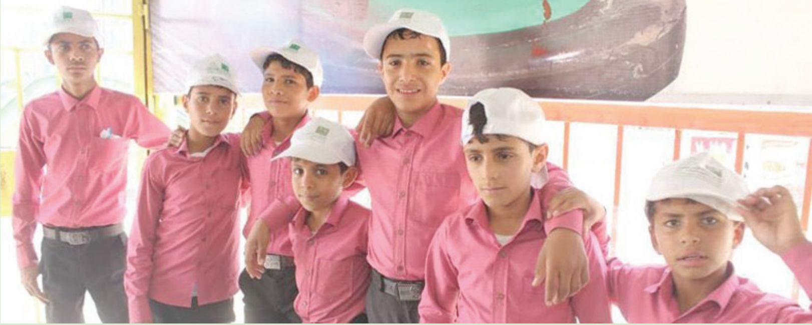
أطفال جندهم الحوثيون وأعاد تحالف دعم الشرعية في اليمن تأهيلهم