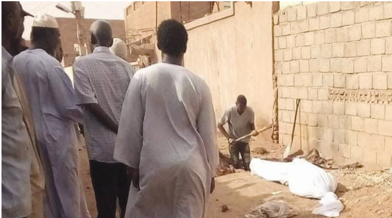
صورة متداولتها على وسائل التواصل الاجتماعي لمواطنین في حي المسالمة بأم درمان وهم يدفنون جثمان أحد قتلى الحرب

مخاوف من تلوُّث بيئي واسع بسبب الجثث المتعفنة