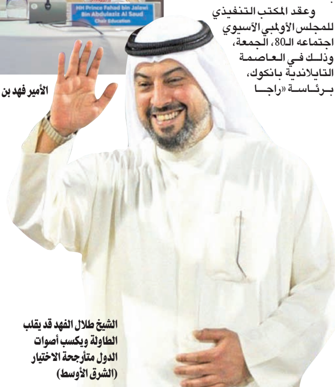
الشيخ طلال الفهد قد يقلب الطاولة ويكسب أصوات الدول متارحة الاختيار (الشرق الأوسط)

وعقد المكتب التنفيذي للمجلس الأولمبي الآسيوي اجتماعه الـ8، الجمعة، وذلك في العاصمة التايواندية بانكوك، برئاسة «راجسا