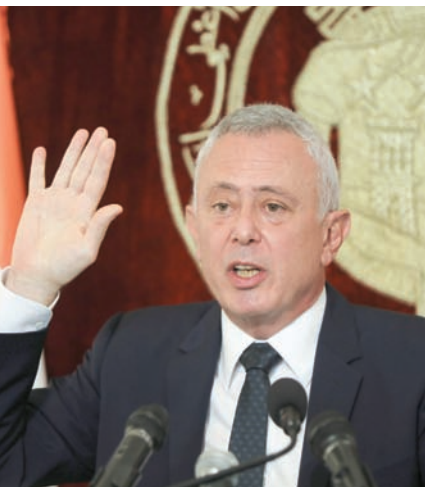
سليمان فرنجية

هو نوع من أنواع الموت». ويتابع: «منذ عام 1970 ونحن نتخبط في المديتين مستسلمين، لعجزنا عن إنتاج حل داخلي بسبب سطوة السلاح والتلطي وراء الميثاقية». أما الدكتور هلال خشان، أستاذ العلوم السياسية في الجامعة الأميركية ببيروت، فقال، لـ«الشرق الأوسط»، إن «اللبنانيين فقدوا منذ مدة المبادرة والقرار بالملف الرئاسي، كما أنه يتبني حزب الله ترشيح فرنجية... يكون بذلك عملياً هو مرشح إيران باعتبار أن الحزب الواقع منظمة إقليمية»، ثم أوضح أن «توازن القوى الحالي في لبنان لا يسمح لإيران بفرض مرشحها، كما لا يسمح للفريق الآخر بذلك». لذا يتوقع خشان ألا يُنجز انتخاب رئيس «إلا بعد خضبة كبيرة، مع ترجيح أن تكون ضربة إسرائيلية، يُصارع بعدها إلى انتخاب قائد الجيش العماد جوزيف عون رئيساً للبلاد». ووفق خشان: «تشعر إسرائيل بأن حزب الله يضعف، وهي تنتظر أن يرتكب خطأ صغيراً لشن حرب هدفها إضعافه، باعتبارها تعد منذ مدة للخيار العسكري».