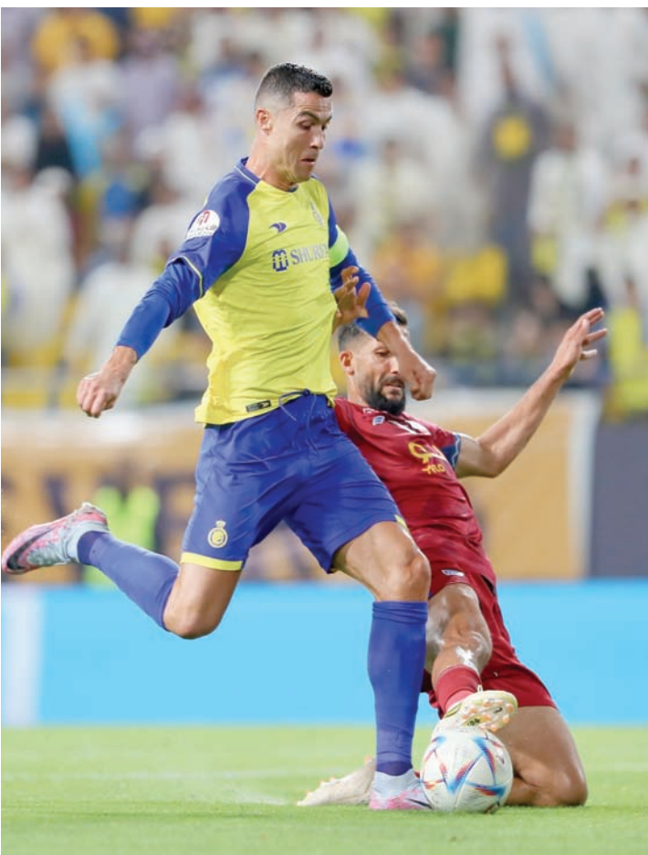
حضور رونالدو منح زخماً هائلاً للدوري السعودي (الشرق الأوسط)