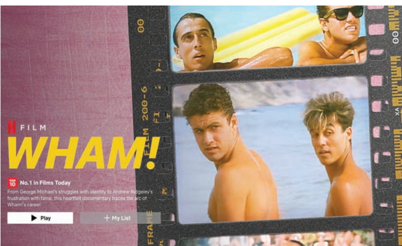
ملصق الفيلم الوثائقي لفرقة «وام!، يُعرض على «نتفليكس»

وأوضح ريدجيلي: «بعض الأمور بقيت طي الكتمان ولم يُكشف عنها بعد»، لأنه عمل خلال السنوات الخمس الماضية في مشاريع تمثل كل ما ترقى إليه فرقة «وام!». وفي عام 2019، نشر مذكرة بعنوان: «وام!، جورج مايكل