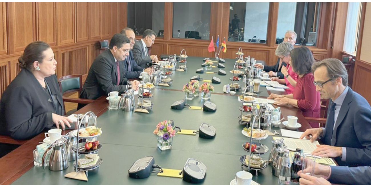
جانب من المباحثات الألمانية - المغربية في برلين الخميس

وأشاد بوريطة وبيربوك بـ«العلاقات الوثيقة والودية القائمة بين البلدين، والدينامية الإيجابية