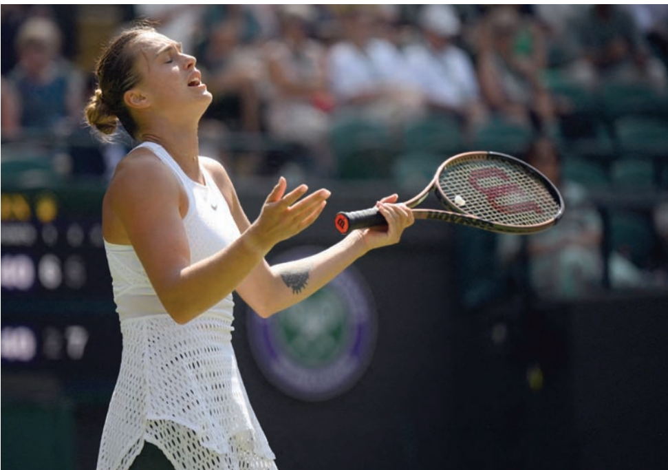
البيلاروسية أرينا سابالينكا

وتفوقت سابالينكا، الثانية عالمياً، على الفرنسية فارفارا غراتشيفا (41) معوضتها تأخرها بمجموعة إلى فوز 6-2، 5-7، 2-6. وعاد مدفيد مع سابالينكا إلى لندن هذا العام بعد حظر اللاعبين الروس والبيلاروس من نسخة العام الماضي بسبب الحرب على أوكرانيا، وتبقى أفضل نتيجة له على