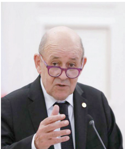
جان إيف لودريان