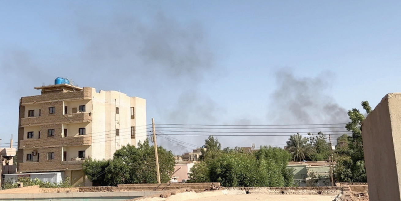
أعمدة الدخان في سماء أمدرمان نتيجة الاشتباكات في 4 يوليو

وتجاوز عدد قتلى حرب الجيش السوداني وقوات «الدعم السريع» في الخرطوم وحدها 900 قتيل، في حين قُتل نتيجة هذه الحرب أكثر من 1000 شخص في مدينة الجنيينة في إقليم دارفور، وأقرب عدد الجرحى والمصابين من 10 آلاف جريح ومصاب، مع نحو 2,5 مليون نازح ولاجئ.