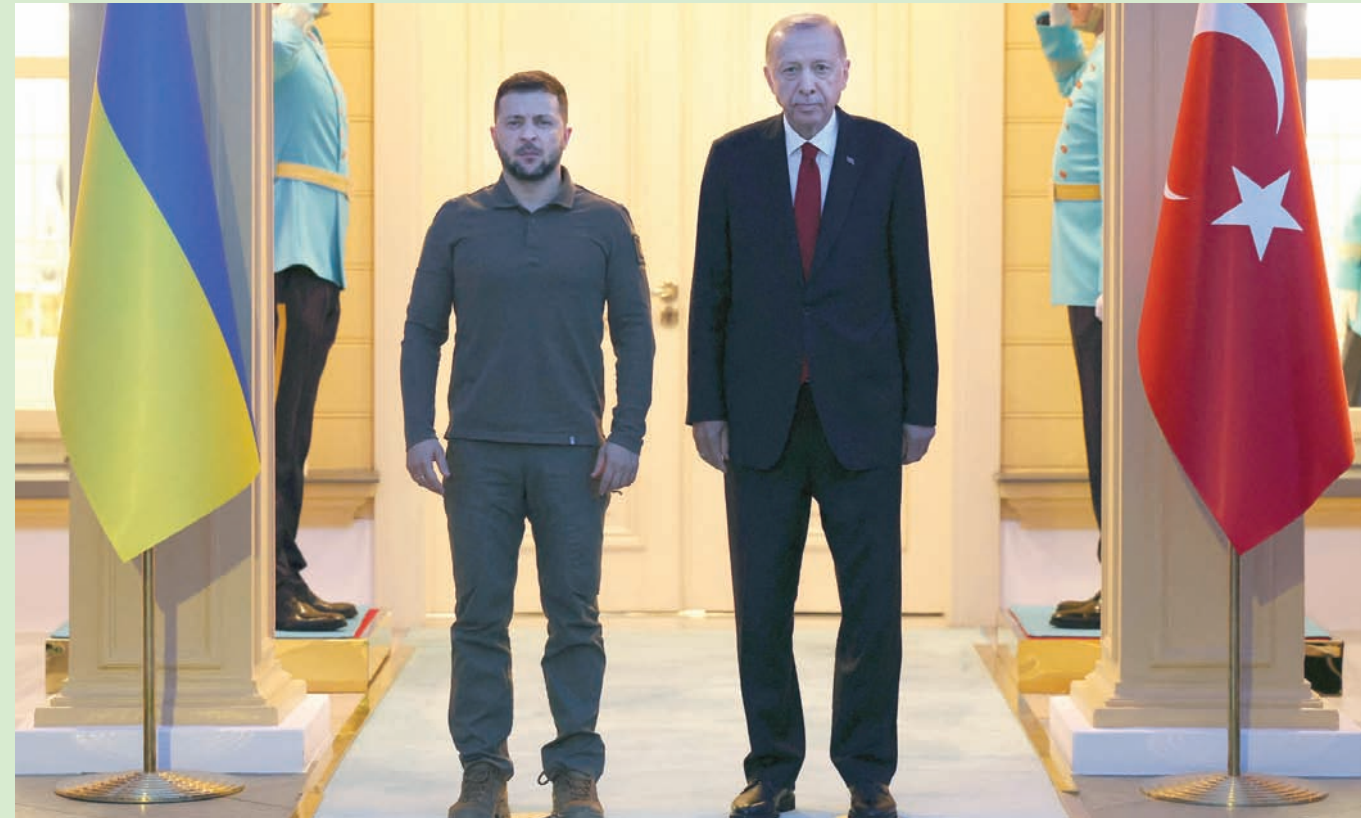
الرئيس الأوكراني فولوديمير زيلينسكي مع الرئيس التركي رجب طيب إردوغان في إسطنبول أمس

بين شركات البلدين. وقبل ذلك، قال زيلينسكي في تصريحات من العاصمة السلوفاكية براتيسلافا: «نتوقع وحدة صف من الحلف (الناتو)؛ لأن قوته في وحدته»، في إشارة إلى قمة الحلف الثلاثة والأربعاء في فيلنيوس. واستبق الكرملين لقاء زيلينسكي وإردوغان بالقول: «سنتابع نتائج المحادثات عن كثب. نحافظ على علاقات شراكة بناءً مع أنقرة، ونقدر هذه العلاقات، ونشعر بأن الجانب التركي بدوره يتعامل بالمثل». في غضون ذلك، وافق الرئيس جو بايدن على منح أوكرانيا ذخائر