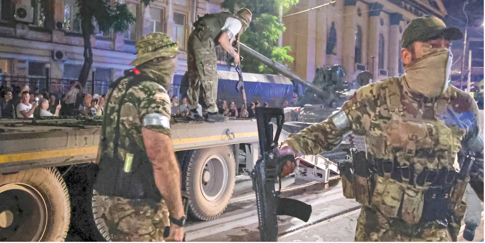
عناصر من «فاغنر» بجانب دباباتهم في روستوف أون دون

وتعددت محاولات واشنطن على مدار السنوات الماضية من أجل إقناع روسيا بتسليمه، لكن دون جدوى، وهو الأمر الذي دفعها إلى محاولة الانقلاب الفاشلة في 15 يوليو (تموز) 2016 باعتباره مدير المحاولة، وكذلك تسليم عناصر الحركة ووقف أنشطتها في أميركا.