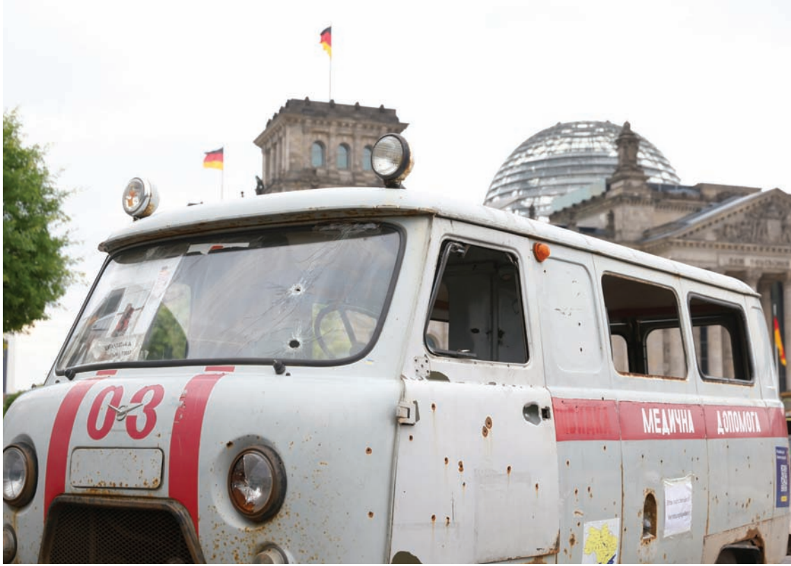
سيارة إسعاف أوكرانية تعرضت لهجوم بقنبلة عنقودية

وافق الرئيس الأمريكي، جو بايدن، على منح أوكرانيا الذخائر العنقودية الأميركية من مخزونات وزارة الدفاع. وتأتي هذه الخطوة التي تتجاوز القانون الأميركي الذي يحظر إنتاج أو استخدام أو نقل الذخائر العنقودية، وسط مخاوف من تأخر هجوم كيف المضاد وتعثره في مواجهة القوات الروسية المحسنة، وتساؤل المحرّضات الغربية من المدفعية التقليدية.