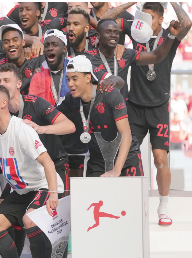
بايرن ميونيخ يفوز بلقب الدوري الألماني الممتاز للمرة الحادية عشرة على التوالي

لقد كان يونيون برلين استثنائياً للغاية، منذ صعوده للدوري الألماني الممتاز عبر ملحق الصعود في عام 2019، وحتى التعادل مع ماكس كروس والتأهل إلى البطولات الأوروبية بشكل متتال. وخلال هذا العام، تمكن النادي - على الرغم من خسارة جهود كل من تايبو أونيني وغريشا بروميل وجوليان رايسون - من التأهل إلى دوري أبطال أوروبا، واختتم الموسم بفوز دراماتيكي بهدف جميل في الوقت القاتل من توقيع راني خضيرة في مرمرى فيرير برلين في الجولة الأخيرة. في الحقيقة، كان النجاح الكبير الذي حققه يونيون برلين منطقياً وطبيعياً، في ظل التنظيم الكبير والحماس الهائل الذي يلعب