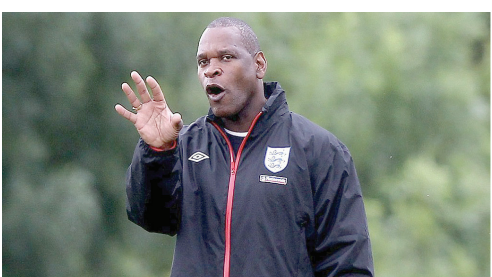
نويل بليك المدير الفني السابق للمنتخب الإنجليزي تحت 19 عاماً

يقول دينتون، الذي يعمل أيضاً كمطور في مجال التدريب في الاتحاد الإنجليزي لكرة القدم: «هناك الكثير من المدربين السود الموهوبين الذين يرغبون بشدة في العمل في كرة القدم، لكن الكثيرين منهم خارج كرة القدم