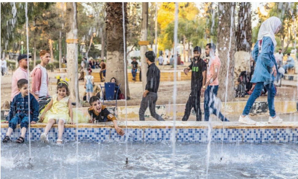
سوريون في متنزه بمدينة إدلب التي تسيطر عليها فصائل المعارضة شمال غربي سوريا الشهر الماضي

كما يشكل ملف اللاجئين إحدى القضايا الرئيسية التي تدور على