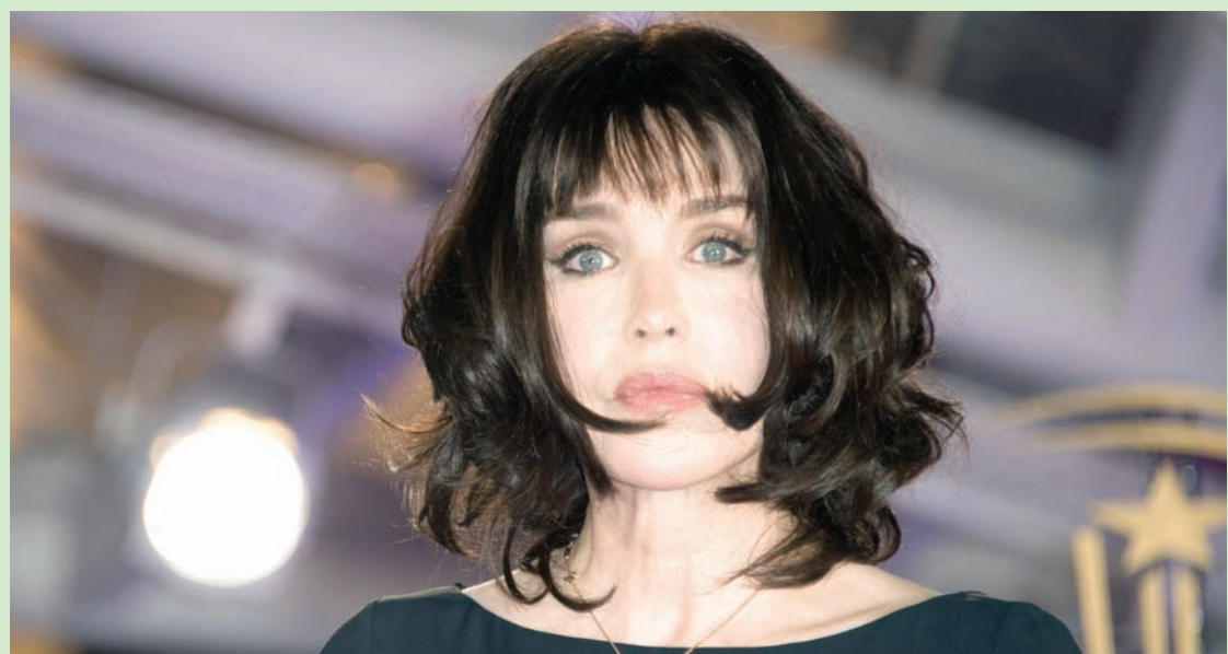
الممثلة الفرنسية إيزابيل أدجاني

وتذكر بأغنية «تايكول» التي لكنها الفرنسية كافينسكي وشكلت الموسيقى التصويرية لفيلم «درايف».