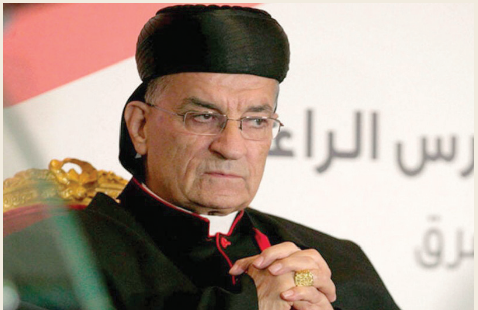
البطريرك بشارة الراعي

أما أبرز المبادرات الداخلية لحل الأزمة الرئاسية فهي: - «مبادرة الإنقاذ الرئاسية» التي أطلقها نواب «التغيير»، مطلع شهر سبتمبر (أيلول) الماضي. ولحظت وثيقة المبادرة أربعة أجزاء: الرؤية، والمقاربة، والمعايير، والمبادرة. ولقد جال نواب «التغيير» بمبادراتهم على الكتل السياسية، لكن أي خرق لم يسجل في جدار الأزمة؛ لأن الأسماء التي طرحت لم تلق إجماعاً، حتى إنها أدت إلى انقسام كتلة التغييريين النيابي، على خلفية تأييد كل مجموعة من النواب مرشحاً مختلفاً عن المجموعة الأخرى. - في أكتوبر الماضي أطلق «التيار الوطني الحر» ما عُرف بـ«ورقة الأولويات الرئاسية»، التي جال بها على قسم كبير من القوى السياسية. لكن خلافات رئيس «التيار» مع قسم كبير من هذه القوى جعل تقتلهم لما يطرحه صعباً جداً، حتى إن «القوات اللبنانية» لم توافق على لقاء وفد «التيار»، الذي لم يكن يطرح أصلاً أسماء، بل ما هو أشبه ببرنامج رئاسي اعتبر أن التفاهم عليه يسهل التفاهم على اسم رئيس.