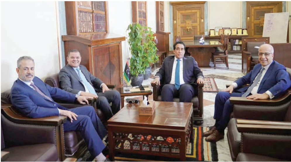
لقاء سابق يجمع المنفي والديببة والكبير وبن قدارة (المجلس الرئاسي الليبي)

التيار بشكل جزئي على بعض مناطق المدينة»، وطمنت الشركة السكان بأن فرق الصيانة التابعة لها في حالة تأهب لصيانة الأضرار وإعادة التيار فور انتهاء الاشتباكات.