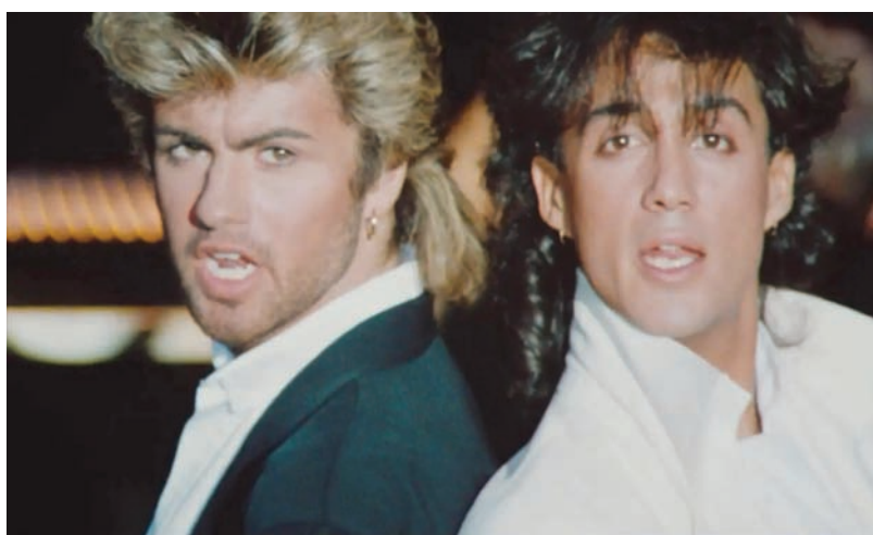
قال ريدجيلي إن علاقته مع مايكل استمرت حتى بعد انتهاء فرقة «وام!، «نتفليكس»

وأنا»، وتبرز دوره خلال ذلك العام في فيلم «لاست كريسماس» الرومانسي الكوميدي، المستوحى اسمه من اسم أغنية منفردة للفرقة الموسيقية تصدرت النتائج من قبل. وفي وقت لاحق من الشهر الحالي، يصدر البوم بعنوان: «أصداء من حافة السماء»، عبارة عن مجموعة الأغاني المنفردة لفرقة «وام!».