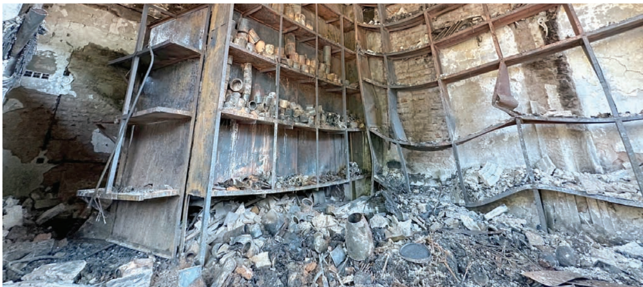
آثار الدمار الذي لحق بأحد المباني جراء الاشتباكات في أمدرمان 4 يوليو