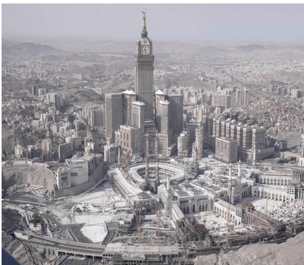
منظر جوي عام لمدينة مكة المكرمة يتوسطه المسجد الحرام ويحيطه عدد هائل من الفنادق والمنشآت الخدمية

ويعتقد الوجيهين أن هذا الأمر سينعكس إيجاباً على القطاع والمُعتمرين الراغبين في زيارة المدن والمواقع السياحية والتراثية، حيث سيشجع لهم ذلك البقاء في مكة والمدينة للاستفادة من الطاعات واستدامة الحوار لأطول فترة ممكنة،