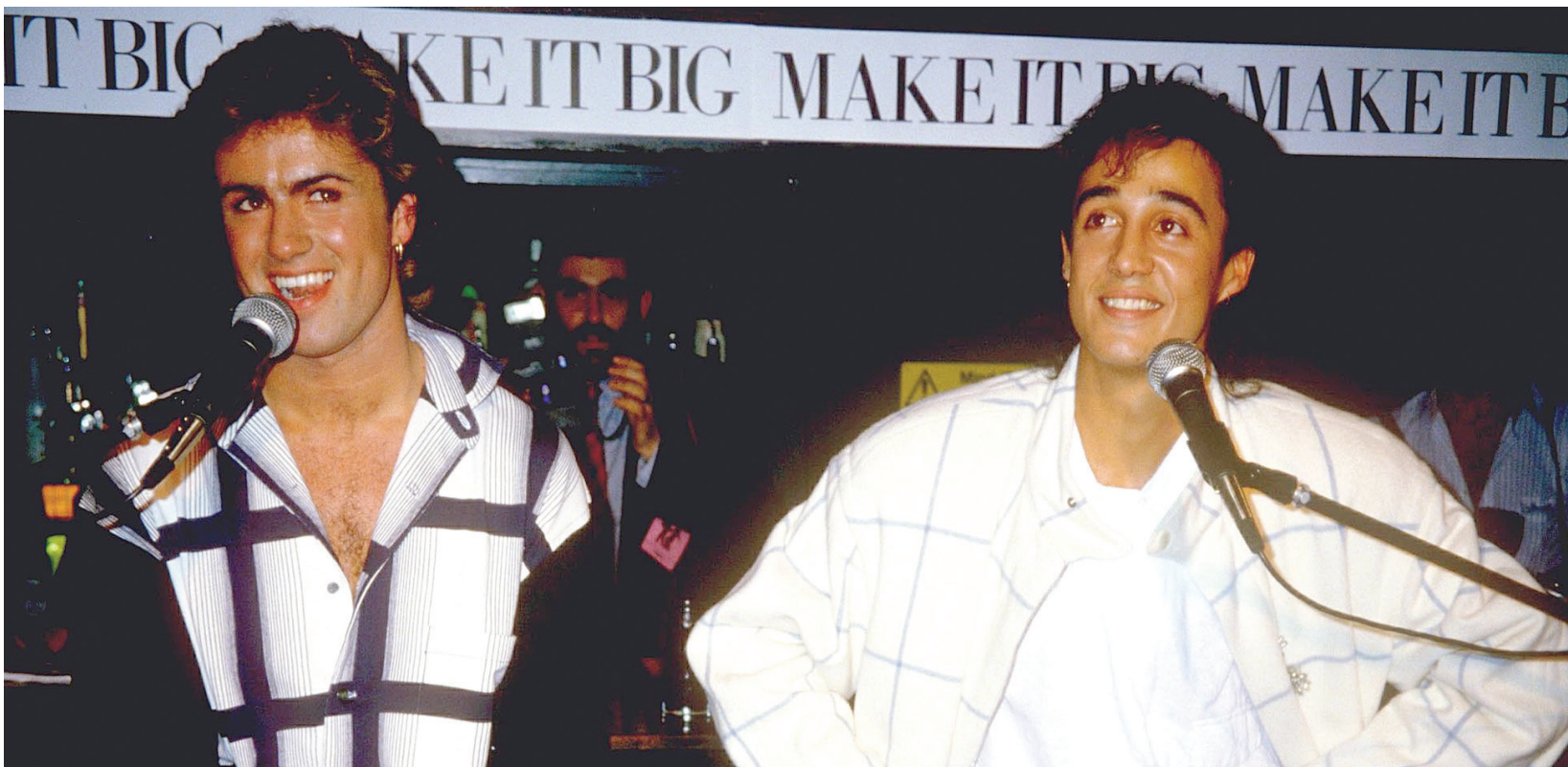
ريدجيلي ومايكل في ذروة شعبيتهما المبكرة

«فورمبولاً ثري»، لكنه فضل البقاء بعيداً عن الأضواء. ظلت الصحف البريطانية الشعبية تراقب حياته العاطفية دونما توقف، بما في ذلك علاقته التي استمرت 25 عاماً مع المطربة البريطانية كيرين وودورد، عضو في فرقة «باناناراما» الموسيقي البوب من الثمانينات.