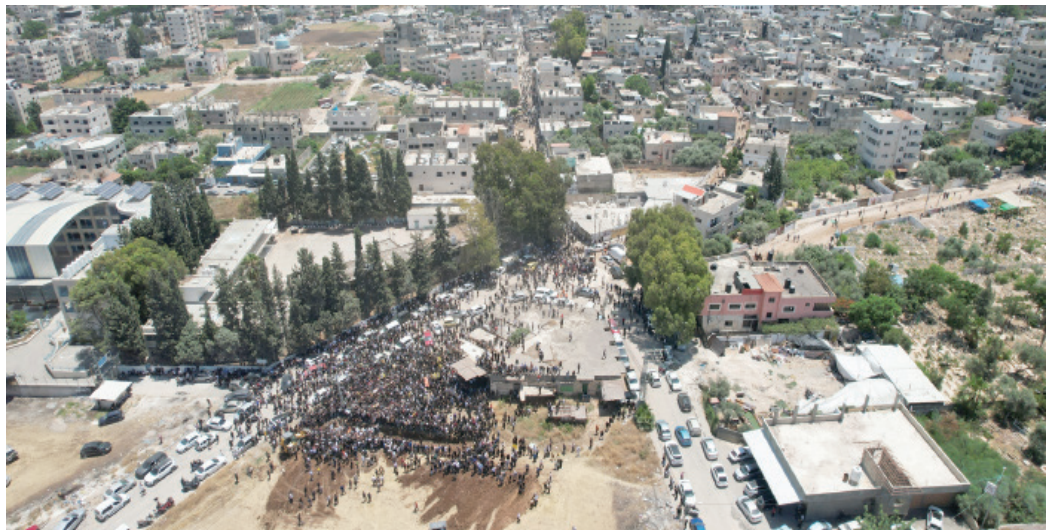
تشيع الفلسطينيين الذين قتلوا في العملية العسكرية الإسرائيلية في جنين خلال اليومين الماضيين

العملية «لم تبعث لديهم مزيداً من الشعور بالأمان». بينما قال 8 في المائة إنه «لا يوجد لهم رأي في الموضوع»، ولوحظ أن هذا الاستطلاع نشر في وقت بدأت فيه وسائل الإعلام العربية عموماً، ووسائل الإعلام التي تنطق بلسان أحزاب اليمين بشكل خاص، تحت على عملية عسكرية ضد «حزب الله» وانتقد «الرد الناعم» على قيام تنظيم فلسطيني مسلح بإطلاق قذائف صاروخية من لبنان باتجاه إسرائيل (الخميس)، الذي اقتصر على قصف مدفعي مضاد، وتحدث عن «توتر عال في الحدود الشمالية يندرج بعملية حربية حتمية».