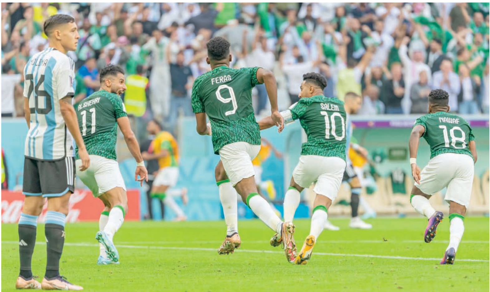
دي ستيفانو قال إن السعودية دخلت حقبة جديدة، بتطوير كرة القدم المحلية والاستثمار في المواهب الشابة واستضافة البطولات الدولية

التطويرية الكبيرة لكرة القدم، افتتح الدوري الإيطالي لكرة القدم أول مكتب تمثيلي له في منطقة الشرق الأوسط وشمال أفريقيا في أبوظبي. وتعد هذه الخطوة الشغف الكبير للمشجعين عموماً الشعبية الكبيرة لكرة القدم الإيطالية بشكل خاص، مع وجود ما يقدر بنحو 16 مليون مشجع للكالتشيو بين سكانها، تقل أعمار نصفهم عن 25 عاماً، حيث يسعى الدوري لتعزيز وجوده وإشباع شغف محبيه وعشاقه في المنطقة.