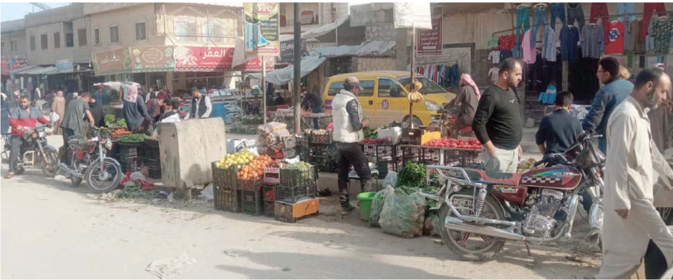
أسواق ومحال تجارية في مدينة إدلب (الشرق الأوسط)

وضع انهيار سعر صرف الليرة التركية أمام الدولار مؤخراً، السوريين في مناطق النفوذ التركي والمعارضة السورية، شمال غربي سوريا، في مأزق اقتصادي ومعيشي جديد، وفي مواجهة مباشرة مع غلاء وتقلبات أسعار الأدوية والسلع الغذائية والصناعية والوقود، مع تراجع كبير في الحركة الشرائية وحركة العمل.