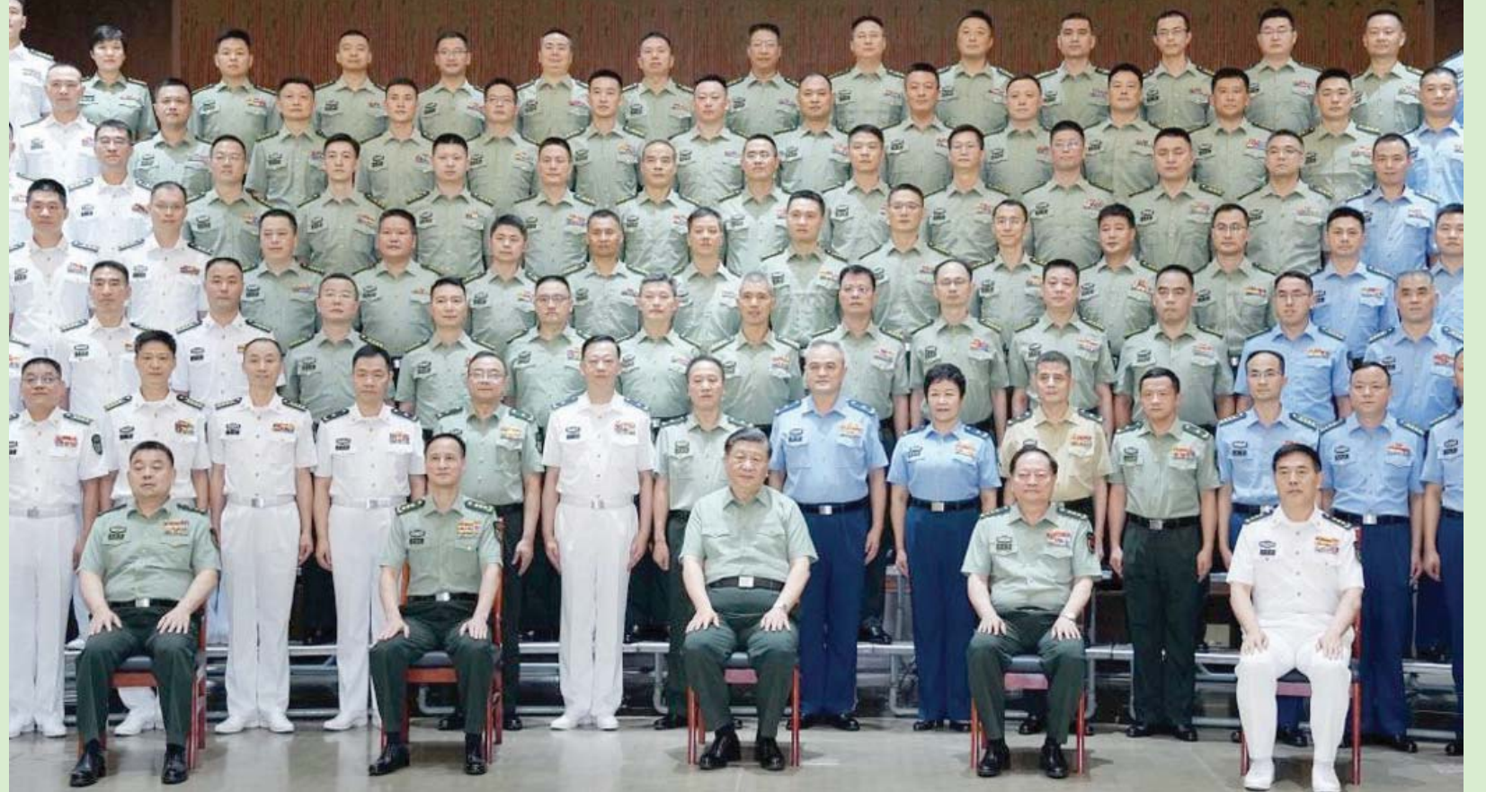
الرئيس الصيني شي جينبينغ لدى اجتماعه مع قادة القوات العسكرية أمس

واشنطن: إيلي بوفس بكين: الشرق الأوسط حضّ الرئيس الصيني شي جينبينغ، أمس (الخميس)، جيش بلاده على التأهب للحرب، وذلك في أثناء تفقده القوات في منطقة متوترة قرب تايوان. وتزامنت تصريحات شي مع زيارة وزيرة الخزانة الأميركية جانتيت بيلين في مسعى لتحسين العلاقات بين بكين وواشنطن. وعلى الرغم من «التوقعات المنخفضة» للنتائج التي يمكن أن يحققها هذه الزيارة، فإن إجماعاً بلبكين قبل أقل من شهر. وتهدف بيلين إلى استكشاف النقاط المشتركة التي يمكن البناء عليها، في حقبة «التنافس» المفتوح بين البلدين. (تفاصيل ص11)