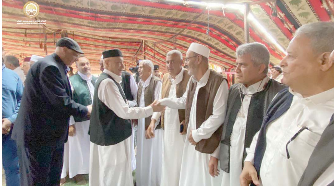
صالح يلتقي وفداً من قبيلة العبيدات بمنطقة الأبرق في شرق ليبيا (المكتب الإعلامي لرئيس مجلس النواب)

واعتبرت البعثة، في بيان رسمي، مساء الأربعاء، هذا الخبر «المرئف»، «جزءاً من حملات التضليل المستمرة لخداع الليبيين وصرف أنظارهم عن الاستحقاقات التي يطالبون بها». وذكرت البعثة بأن باتيلي «أكد» خلال إحاطته الأخيرة أمام مجلس الأمن، التزامه بتكثيف مساعيه الحميدة، وجمع كل الأطراف والمؤسسات المعنية، بما في ذلك مجلس النواب والدولة، بغية التوصل إلى اتفاق شامل وشفاف حول القضايا الخلافية في مشروعات القوانين الانتخابية التي أعدتها لجنة الـ(6 6) لضمان قابليتها للتطبيق، تمهيداً لإجراء