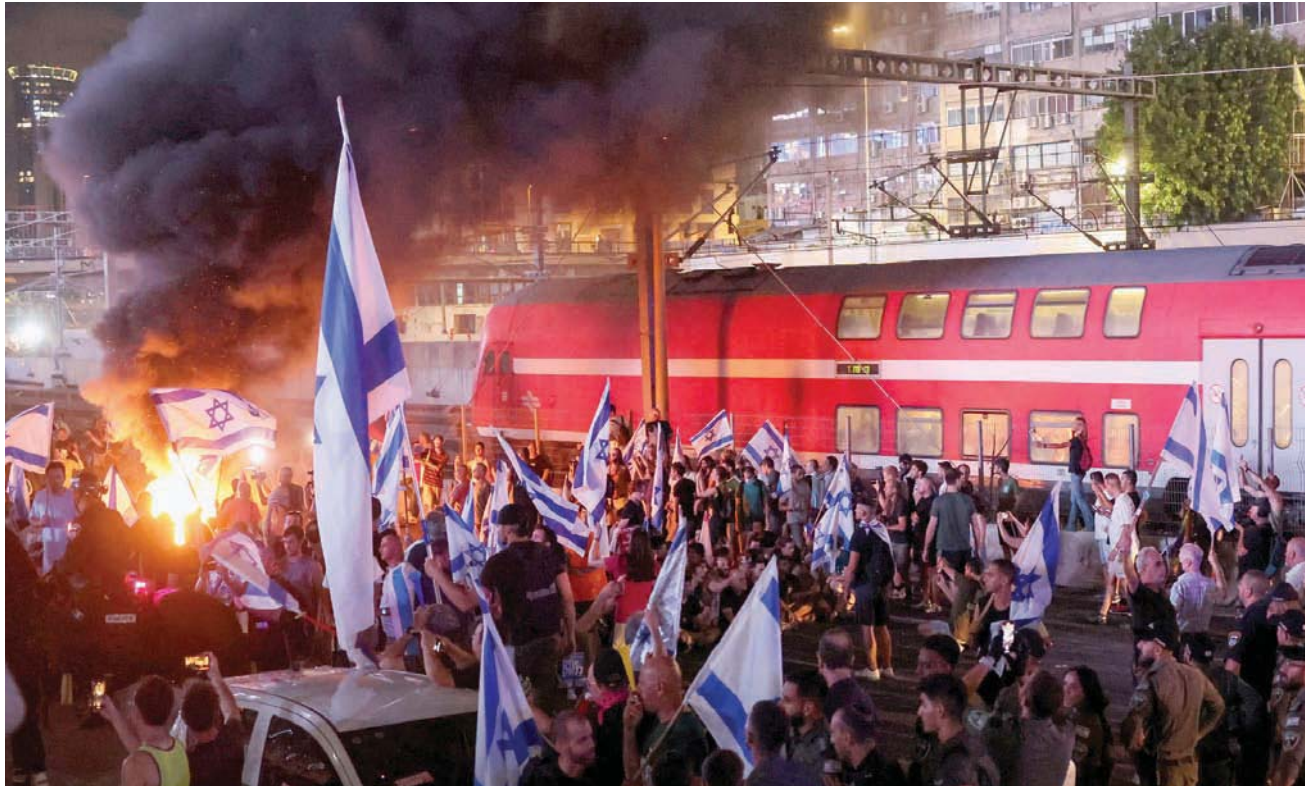
المتجولون على استهداف القضاء في مظاهرة بعد استقالة قائد شرطة تل أبيب فجر الخميس