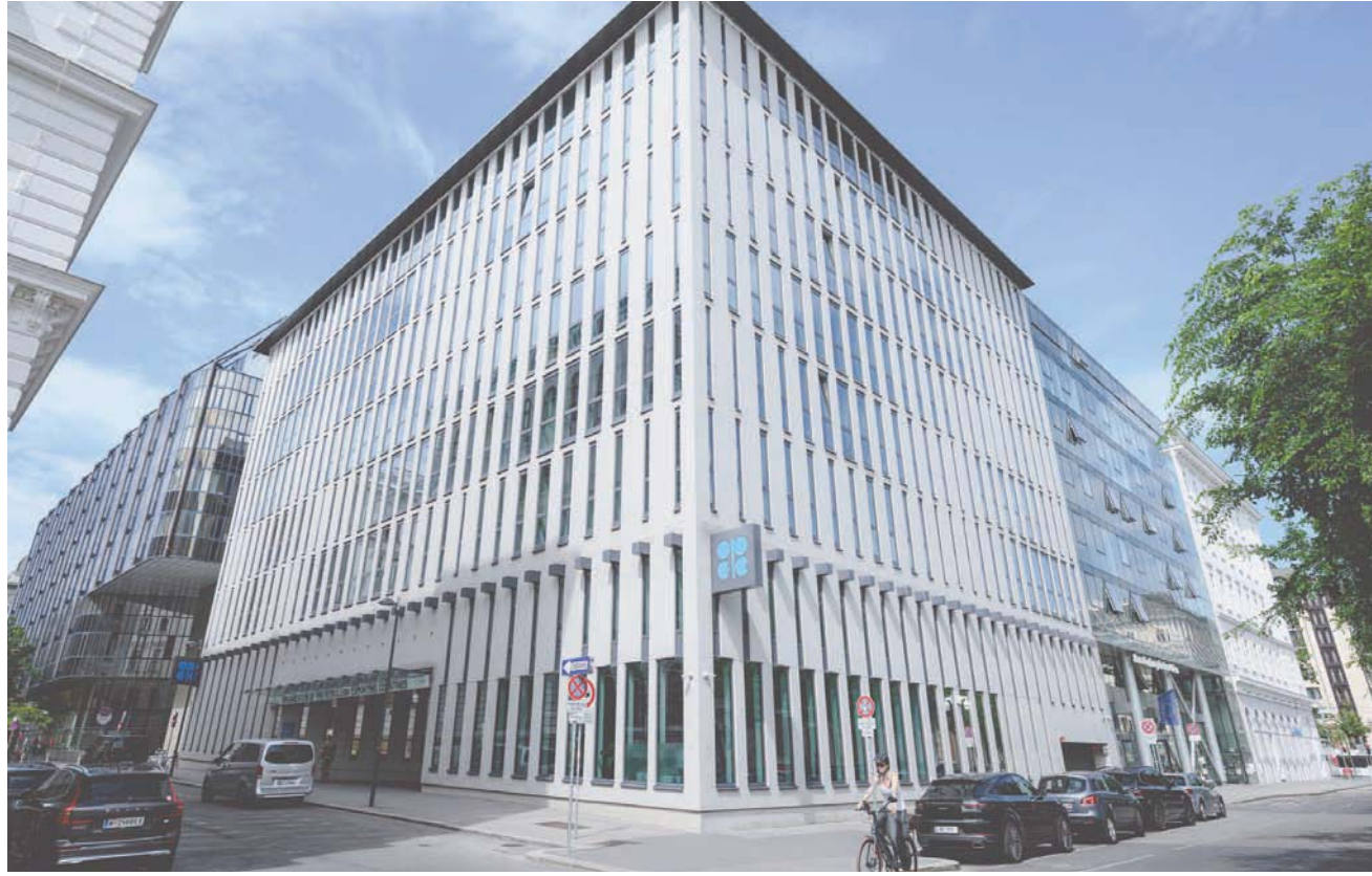
وزراء «أوبك» راجعوا أوضاع السوق خلال اجتماع في فيينا الأربعاء

في منظمة البلدان المصدرة للنفط «أوبك»، وفي «أوبك بلس» لتحقيق الاستقرار في أسواق النفط العالمية. وأضافت الوزارة على «تلغرام» أن اجتماعاً عقد بين عبد الغني والأمير عبد العزيز بن سلمان على هامش مؤتمر «أوبك» في فيينا، أكدا فيه أن التنسيق المشترك لا غنى عنه من أجل استقرار أسواق النفط. ومساء الأربعاء، كشف الغيص، عن تطلع المنظمة لزيادة عدد الدول الأعضاء، حيث جرى التشاور مع دول أندريجان وماليزيا وبروناي والمكسيك حتى الآن للانضمام إلى