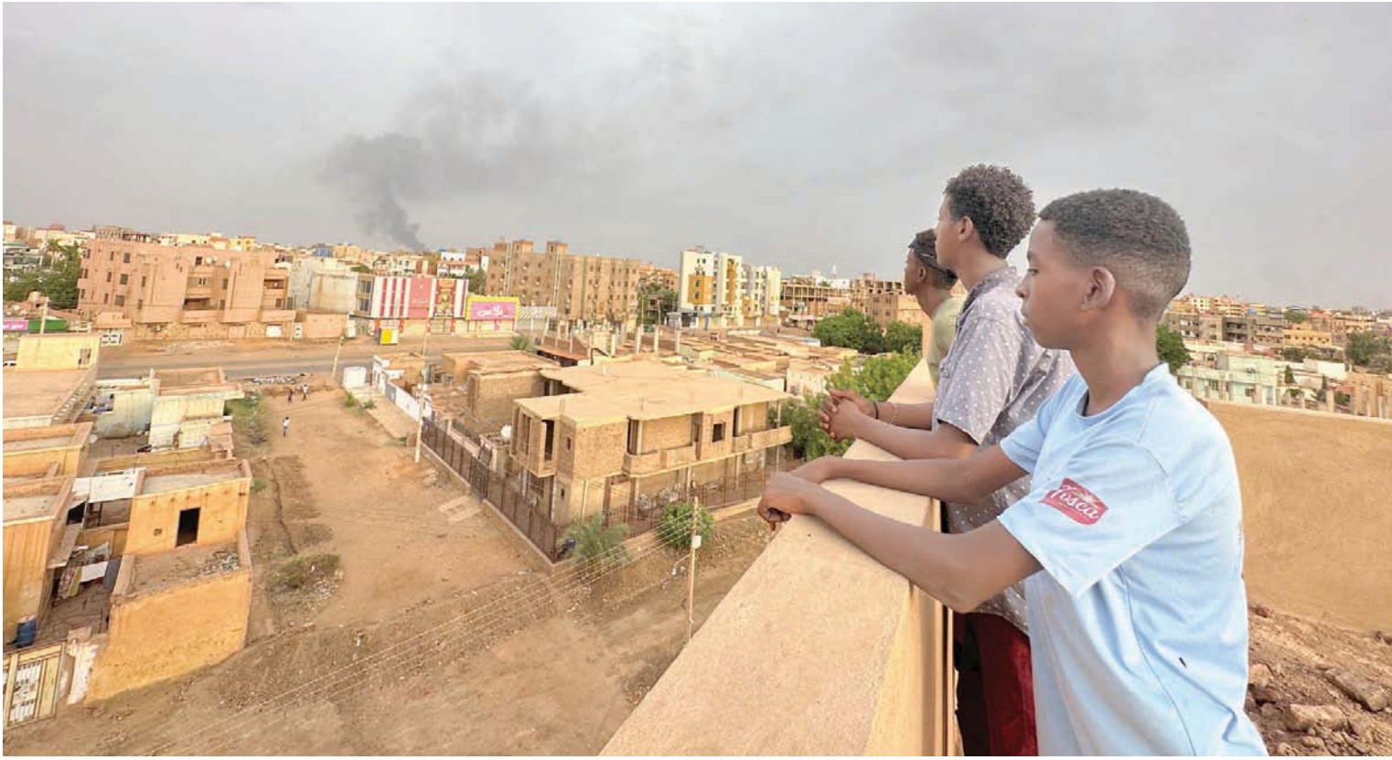
مواطنون يراقبون أعمدة الدخان المتصاعد في سماء أم درمان نتيجة الاشتباكات الأربعاء

نفذ طيران الجيش السوداني ضربات جوية استهدفت مراكز لقوات «الدعم السريع» في مناطق متفرقة من مدينة أم درمان ومناطق في شرق النيل بالخرطوم بحري، فيما عاد الهدوء إلى مدينة الأبيض، عاصمة ولاية شمال كردفان، بعد أيام من الاشتباكات العنيفة. وفي تطور لافت لمسار الحرب في السودان، أعلنت قوات «الدعم السريع»، الخميس، انشقاق ضابط كبير برتبة عقيد في الجيش السوداني رفقة عدد من الأفراد وانضمامهم لقواتها. ولم يصدر عن الجيش السوداني أي تعليق أو رد بخصوص الضابط المذكور.