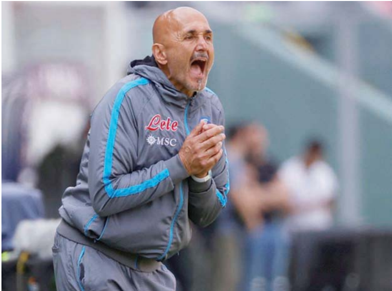
سبالييتي المنتشي بإنجازه الأخير أحد المرشحين لتدريب القلعة