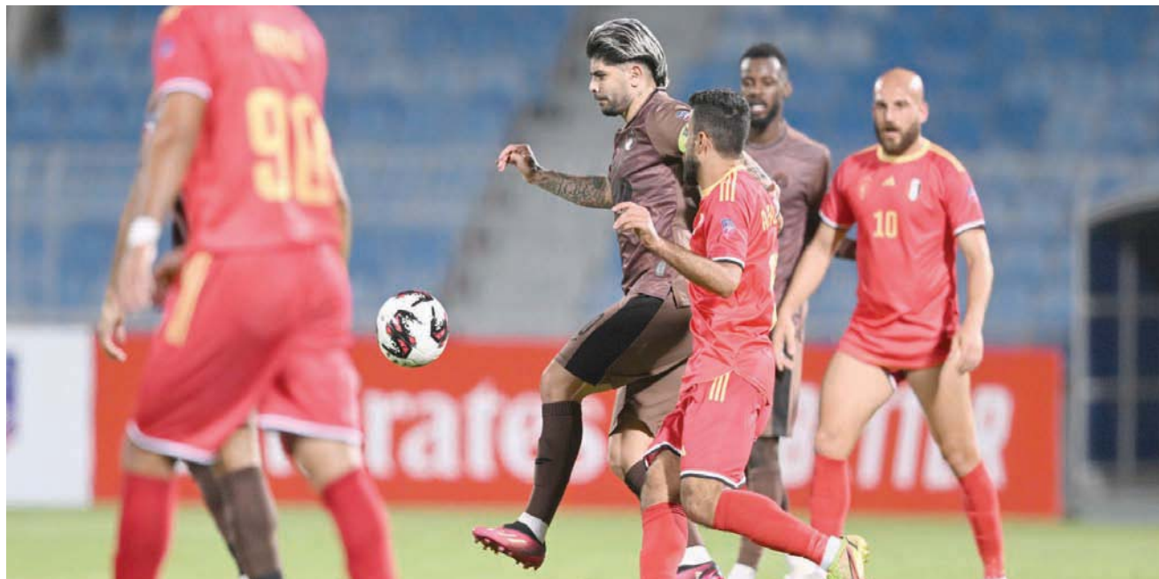
الشباب لحق بالثلاثي السعودي في دور المجموعات

وتبدو الكفة هذه المرة تميل للفرق السعودية التي كانت قريبة من معانقة لقب البطولة في آخر نسختين، حيث تحظى الأندية بدعم كبير ساهم في جلب كبار النجوم حول العالم للمشاركة في النسخة القادمة من