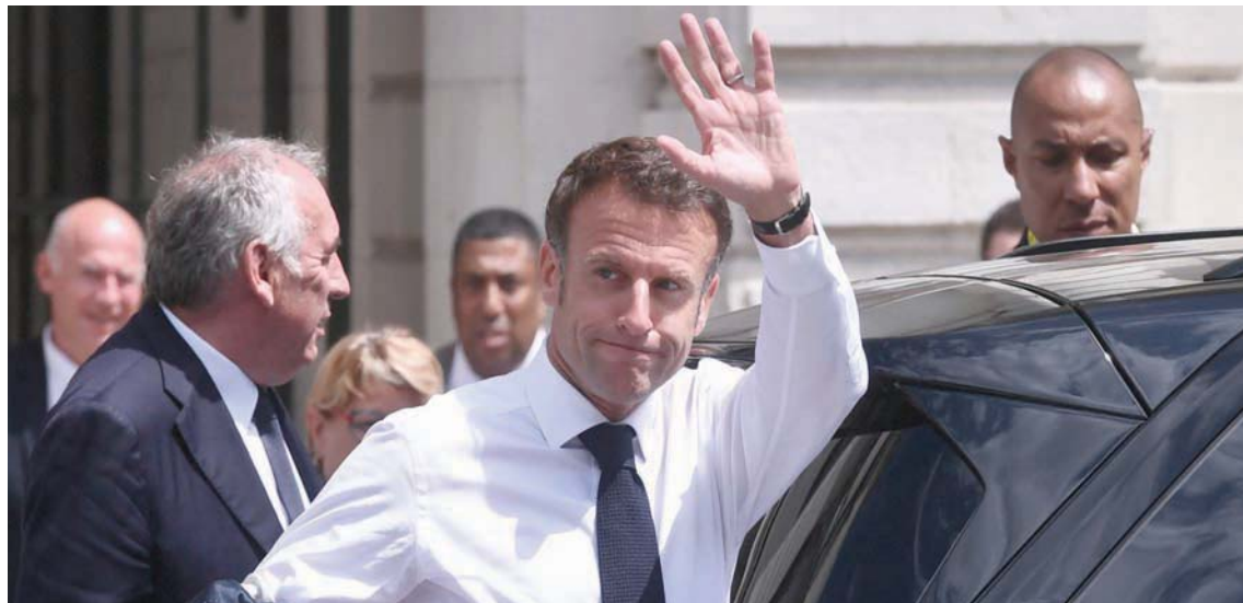
ماكرون لدى مغادرته مدينة بومس

بلد يكون «أكثر احتراماً لمتطلبات البيئة»