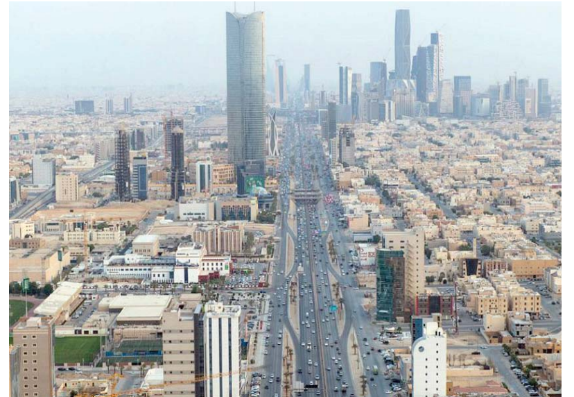
مساح سعودية . مصرية لرفع حجم التبادل التجاري بين البلدين

ووفق نسخة اطلعت عليها «الشرق الأوسط»، طالب «اتحاد الغرف السعودية» جميع الشركات والمؤسسات العاملة في المملكة، بتحديد المعوقات التي تواجه المستثمرين في مصر، قبيل التحضيرات النهائية لـ «منتدى الأعمال الخليجي