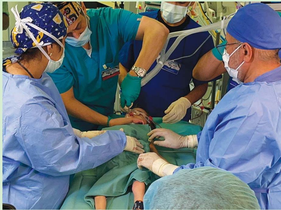
شارك في العملية 26 كادراً طبياً

وفي إطار الدراسة الجديدة، اعتمد الباحثون على أسلوب يطلق عليه «مطيافية الكتلة»، وذلك لتحليل مركبات الرائحة الموجودة في راحة يد 60 شخصاً، نصفهم من الرجال والنصف الآخر من النساء. وبعد تحديد مركبات كل عينة، حلل الباحثون النتائج للتعرف على ما إذا كان يمكن تحديد نوع شخص ما، بناءً على رائحة جسده. واعتمد القائمون على الدراسة نجاحهم في تحديد نوع الشخص بنسبة 96,67 في المائة. وبالنظر إلى أن جرائم مثل السرقة والاعتداء والأغصاب يتركها الجاني بيده، فإنه من المحتمل أن يترك بذلك أدلة قيمة خلفه داخل مسرح الجريمة. وقال مؤلفو الدراسة: «يمكن تطبيق هذا الأسلوب في تحليل رائحة اليد حال غياب أدلة تمييزية أخرى، مثل (دي إن إيه)، بحيث يتيح التمييز عبر تحديد النوع والعرق والسن». يذكر أن الدراسة نُشرت بدورية «بلس وأن».