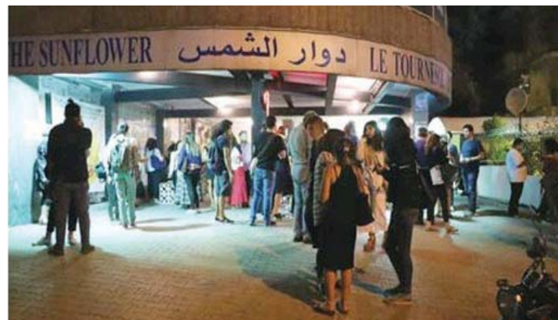
مسرح «دوار الشمس» متوهجاً بالضوء والزوار