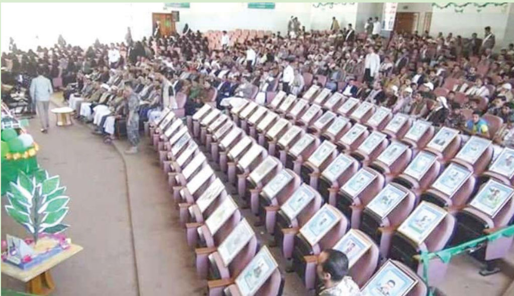
صور قتل تملأ قاعة احتفال نظمته الحوثيون في جامعة ذمار (نوتير)

وتكثف أكاديمي في جامعة ذمار التي طالها ومنتسبها في الفترات السابقة تسفقات بالجملة، أن كليات الجامعة باتت اليوم على وشك الإغلاق بعد عزوف خريجي الثانوية عن التسجيل في أقسامها المختلفة. وذكر أستاذ الأدب والنقد المشارك