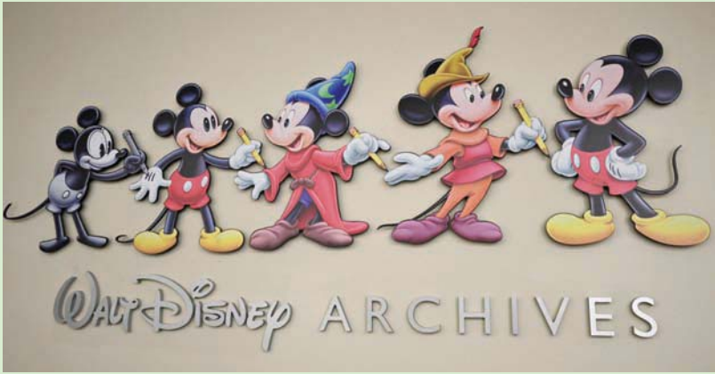
رسوم لميكي ماوس في أرشيف والت ديزني

لندن: الشرق الأوسط مئات الأغراض، إلى المجموعة في كل مرة ينتهي فيها فيلم ما، بحسب كارول. ولبعض الأدوات المخزنة قوائد أحياناً؛ إذ استُخدمت كرة تلجية من فيلم «ماري بوينز» (1964) لايتكار نسخة طبق الأصل مخصصة لجزء تكميلي من مغامرات المريية ذات القوى السحرية صدر عام 2018.