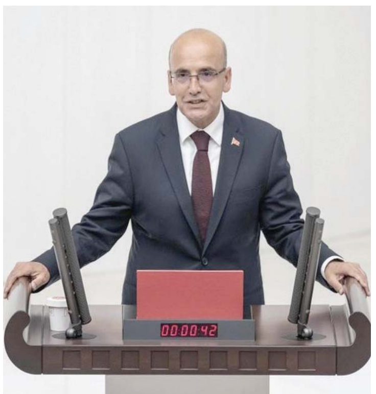
وزير الخزانة والمالية التركي (حسابه الشخصي)

وارتفعت عائدات المسافرين بنسبة 100 في المائة خلال العام الماضي، وذلك نتيجة زيادة السعة بنسبة 31 في المائة، مسجلة بذلك عوائد أعلى بنسبة 9 في المائة، وزيادة معدل إشغال المقاعد بنسبة 80 في المائة - وكلاهما يعد الأعلى في تاريخ الناقل القطرية - مما أدى إلى نمو وزيادة