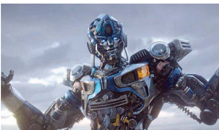
«متحولون: صعود الوحوش» (باراماونت)

تحقيق مليار و200 مليون دولار، لكنه لم يفعل.