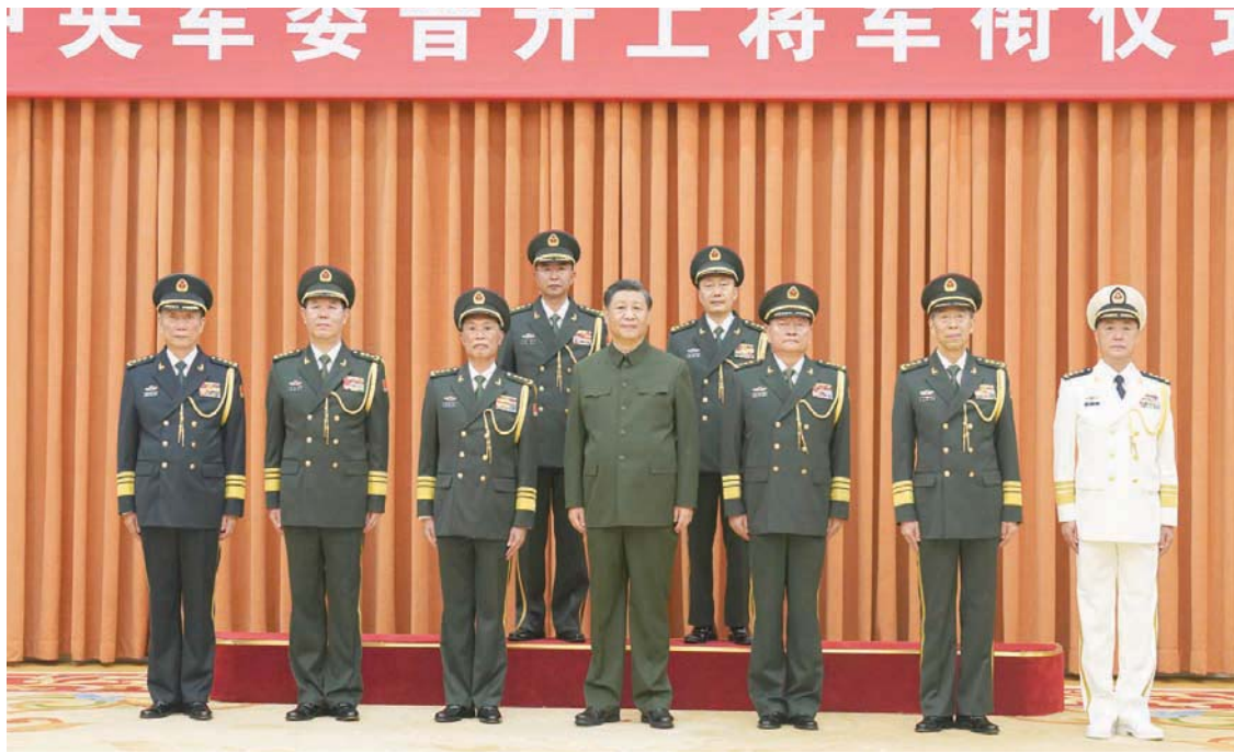
شي برفقة قادة عسكريين صينيين في بكين يوم 28 يونيو

تزامنت تصريحات شي مع زيارة وزيرة الخزانة الأميركية جانيت لين، في مسعى لتحسين العلاقات بين بكين وواشنطن. وعلى الرغم من «التوقعات المنخفضة» عن النتائج، التي يمكن أن تحققها هذه الزيارة، فإن إجماعاً يكاد يسود بأنها «ضرورية»، ليس فقط لإعادة ضبط العلاقات المتدهورة بين البلدين، بل لأنها قد تكون حاجة ملحة للصين التي تتخشي من تداعيات كبيرة على اقتصادها في هذه المرحلة. وستعطي لين، التي تصفها الصين بأنها «صوت العقل» في الإدارة الأميركية، 4 أيام حافلة بلقاءات مهمة. ولم تعرف بعد ما إذا كانت ستلتقي الرئيس الصيني، الذي التقى وزير الخارجية أنتوني بلينكن، قبل أقل من شهر. وتهدف لين إلى استكشاف