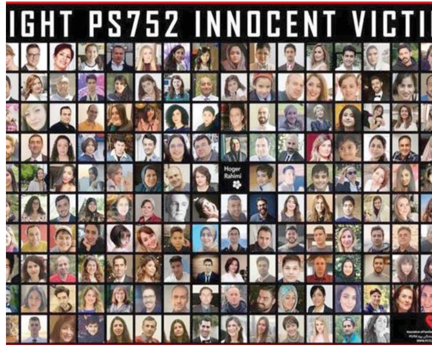
صورة متداولة لضحايا الطائرة الأوكرانية

وتجلى أهمية هذا الخبر بالنسبة لأسر ضحايا طائرة الركاب في بيان جاء فيه: «مر 42