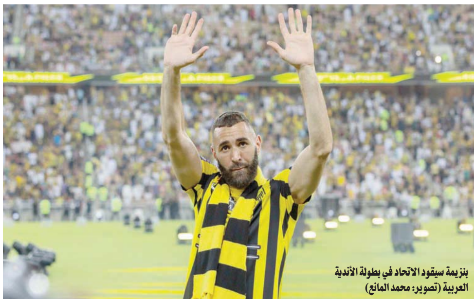
بزعامة سيقود الاتحاد في بطولة الأندية العربية

البطولة التي تحضر في افتتاحية الموسم الجديد.