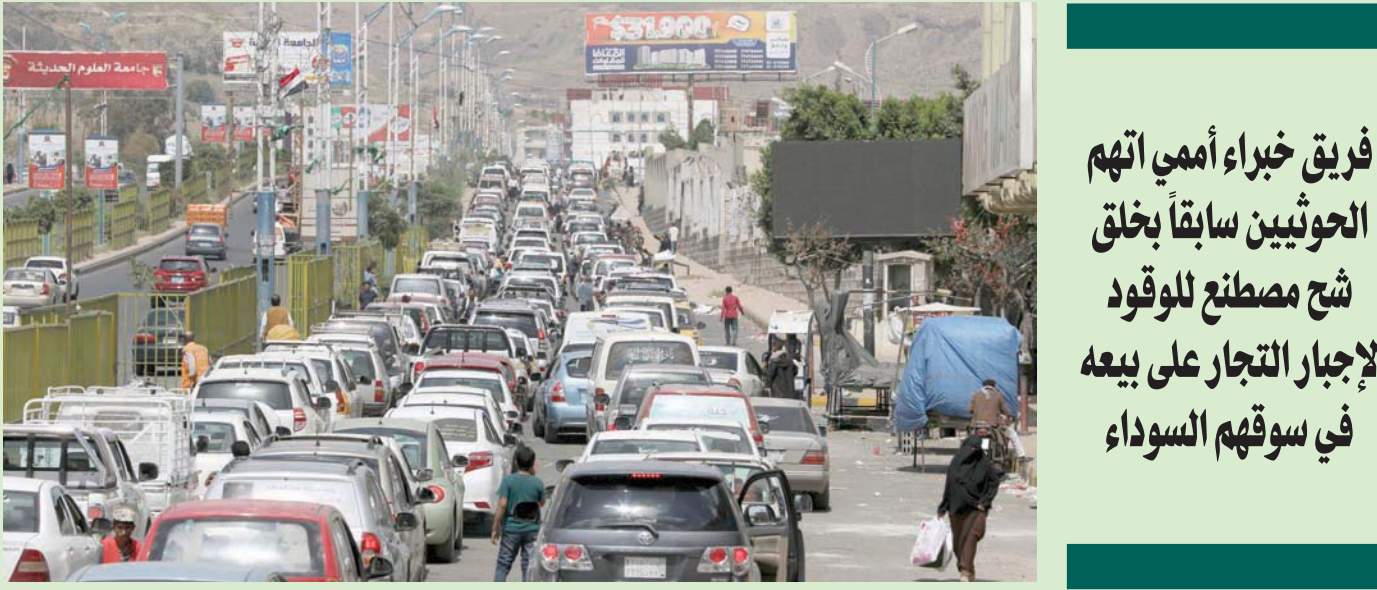
طوابير طويلة للسيارات أمام محطات الوقود في صنعاء بسبب أزمات الوقود المتكررة