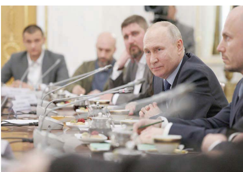
بوتين خلال اجتماع مع صحافيين مختصين في الشأن العسكري بالكرملين

المرجح أن يحتفظ وزير الدفاع سيرغي شويغو، ورئيس هيئة الأركان العامة فاليري غيراسيموف بمنصبها. وتبدو التقارير بشأن اعتقال الجنرال سيرغي سورفيكين، الذي لم يكن شخصية عامة للغاية قبل التمرد، أنها صراع داخلي أكثر من أي شيء آخر. ومن غير الواضح حالياً، ما إذا كان من المنتظر أن تكون هناك تغييرات في القيادة العسكرية. ورغم أنه من الواضح أن تمرد بريغوجين كان نتيجة لحرب أوكرانيا، فمن المرجح ألا يؤدي إلى أي أفكار بشأن إنهاء الحرب، حيث إن بوتين هو المستشار الرئيسي من «حرب لا نهاها لها».