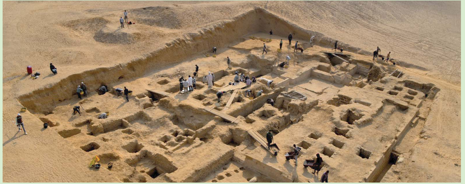
جانب من عمل بعثات التنقيب المصرية