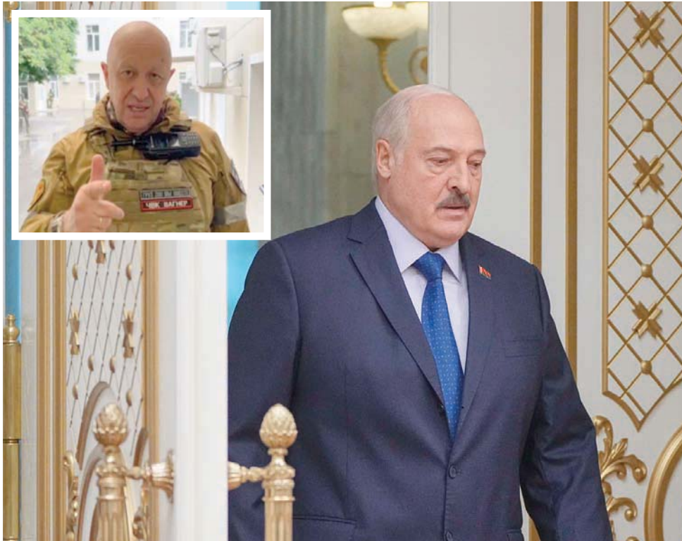
كشف لوكاشينكو في تصريح مفاجئ أن مؤسس «فاغنر» (في الإطار / أ.ب.) موجود في سان بطرسبورغ (إ.ب. أ)

وكان لوكاشينكو قد أعلن، في وقت سابق، ترحيبه بالتعامل مع القوات «فاغنر»، مشيراً إلى أن لدى المجموعة كفاءات مهمة يمكن «الإفادة منها»، لكنه شدد، في الوقت نفسه، على أن «القوات المسلحة في بيلاروسيا جازمة للقتال، وقدراتها ليست أدنى من قدرات «فاغنر»، منوهاً بأن «الخبرة التي تمتلكها قوات (فاغنر) وقادتها، سوف ينقلونها إلى قواتنا المسلحة. أعني الخبرة العسكرية التي تلقوها. التجربة التي نحتاج إليها. وبالدرجة الأولى تختص بالعمليات العسكرية». في الوقت نفسه أشار لوكاشينكو إلى أن «مسألة نشر وحدات فاغنر العسكرية الخاصة في بيلاروسيا لم