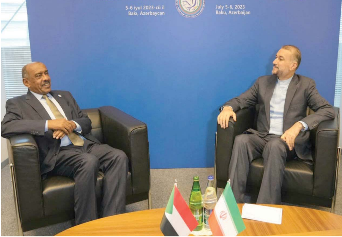
عبداللهيان ونظيره السوداني على الصادق خلال لقائهما في باكو بأذربيجان

بعد قطيعة دامت نحو 7 سنوات يتجه السودان لاستعادة علاقاته الدبلوماسية مع إيران، وذلك في أول نشاط دبلوماسي رسمي لمسؤول سوداني بهذا المستوى.