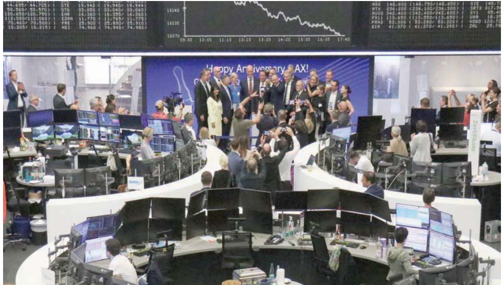
متعاملون في بورصة فرانكفورت الألمانية