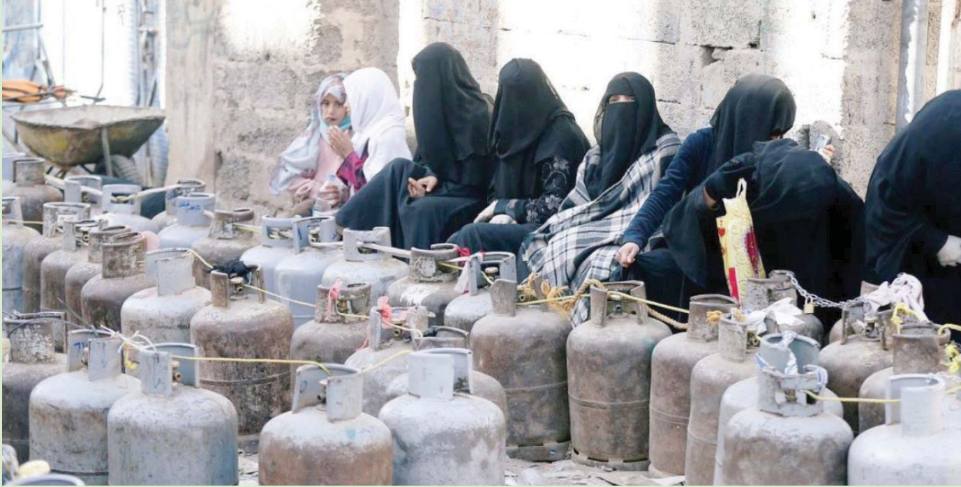
يمنيات في صنعاء ينتظرن أوقاتاً طويلة لتعبئة أسطوانة الغاز

وتفيد المصادر بأنه تم رفض عرض مماثل من أحد المستثمرين في قطاع الكهرباء ببيع الكيلوواط الواحد للمستهلك بمبلغ 66 ريالاً مالياً