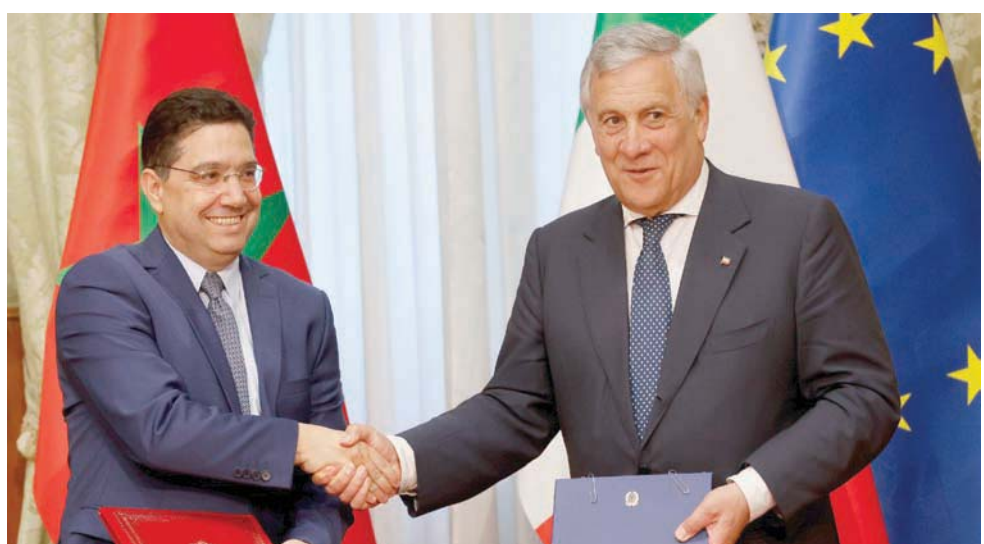
الوزيران المغربي والإيطالي بعد توقيعهما خطة العمل المشترك

ونصت خطة العمل، على أن «إيطاليا ترحب بالجهود الجادة وذات المصادقية المبذولة من طرف المغرب، كما أكد على ذلك قرار مجلس الأمن رقم 2654 الصادر يوم 27 أكتوبر (تشرين الأول) 2022. وفي إشارة إلى مبادرة الحكم