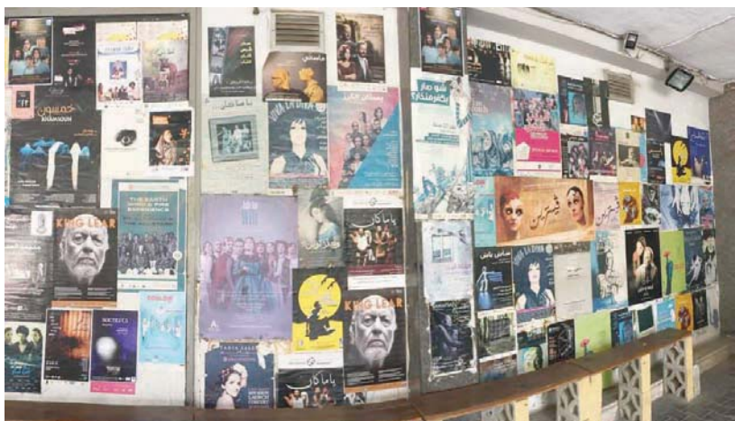
ملصقات المسرحيات التي عُرضت في مسرح «دوار الشمس» أعلى ما احترق (صفحة مركز دوار الشمس على فيسبوك)