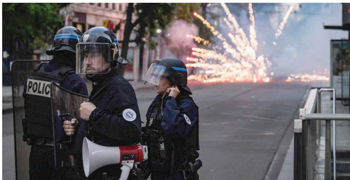
جانب من الصدامات بين الأمن والمتظاهرين في ليون يوم 30 يونيو

التي يتعرّض لها الشباب تكون بإشراف من يسمي «المدافع عن الحقوق، بالتوازي مع تعزيز الوسائل لمحاربة العنصرية المتفشية، بما في ذلك أوساط الشرطة». وبشكل عام، فإن الموقعين يدعون عملياً إلى عقد اجتماعي جديد عنوانه المحافظة على الحريات العامة والخاصة، والعدالة في تقاسم الثروات، ومحاربة الفقر والتهيمش، وارتفاع بدلات الإيجار، وتعزيز خدمات القطاع العام والتعليم.