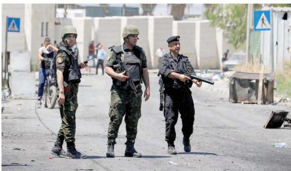
عناصر من قوات تابعة للسلطة الفلسطينية في جنين عقب تشييع جنازة ضحايا عملية إسرائيلية

وتهدت حركة «فتح» بانها «لن تكون عاجزة يوماً عن محاسبة أي مسيء أو متطاول على رموز قيادتها الوطنية وشعبها المغتال في الميدان»، ولن تسمح «لأصحاب الفتن والأجندات الخارجية بالعبث بوحدة شعبنا، ولن تتوانى عن قطع دابر الفتنة».