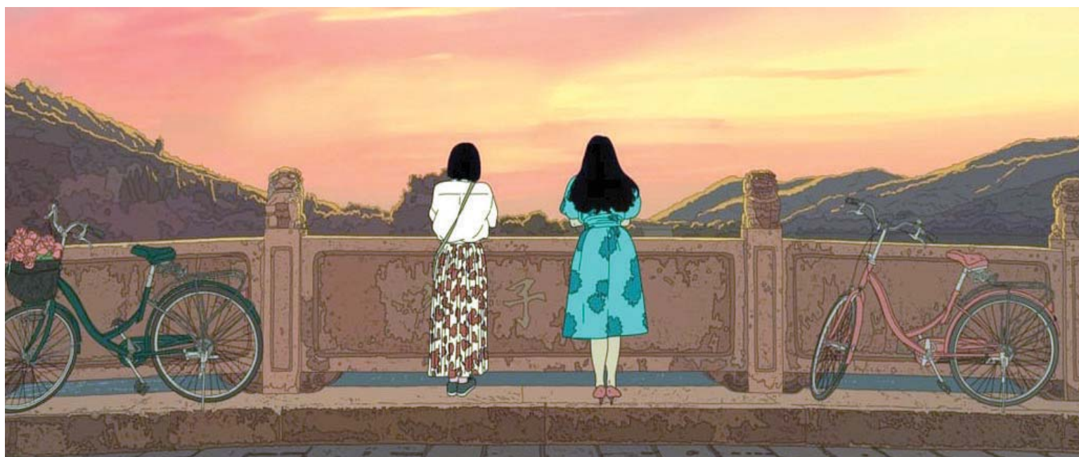
الفيلم الصيني «كلية الفنون، 1994» (مونتو فيلمز)

زمن قرر أن يعيش فيه. لم لم يستخدمها للعودة إلى الماضي أو للانتقال إلى زمن من قبل؟ أرخميدس ليس بيننا اليوم ليقاضي أصحاب الفيلم بتهمة الكذب، لكن هاريسون فورد سيتعامل على نفسه لإنبات أنه ما زال قادراً على خوض المغامرات بالقوة ذاتها.