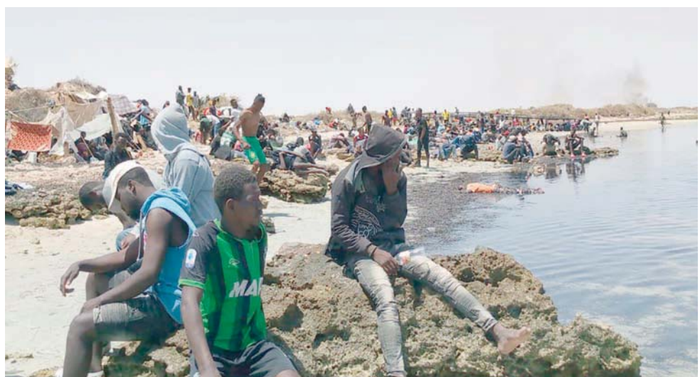
مهاجرون تجمعوا على الشاطئ في صفاقس بانتظار ترحيلهم من قبل السلطات التونسية

صفاقس، مما يخلق توتراً شديداً بين هؤلاء المهاجرين».