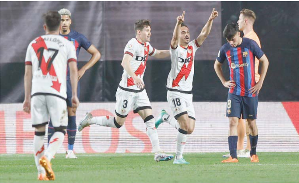
حقق رايبو فايكانو فوزاً ثميناً على برشلونة في أبريل الماضي

في الحقيقة، لم يكن هناك مكان على مدى العامين الماضيين أكثر متعة وإثارة من ملعب فالينكاس، الذي يحتضن مباريات رايبو فايكانو. وفي أحد الأيام، كان إيراولا يستقل دراجته في الحي عندما أوقفه أحد المشجعين. لم يكن رايبو فايكانو يلعب بشكل جيد في تلك الفترة، وكان هذا المشجع يريد أن يعرف السبب وراء ذلك. نزل إيراولا من على دراجته واستمع للمشجّع وأوضح له السبب. وكان إيراولا قد رفض الرحيل في منتصف الموسم، وقبل أن يغادر كانت هناك لافتة في المدرجات تودعه وتقول: «شكراً لك لأنك