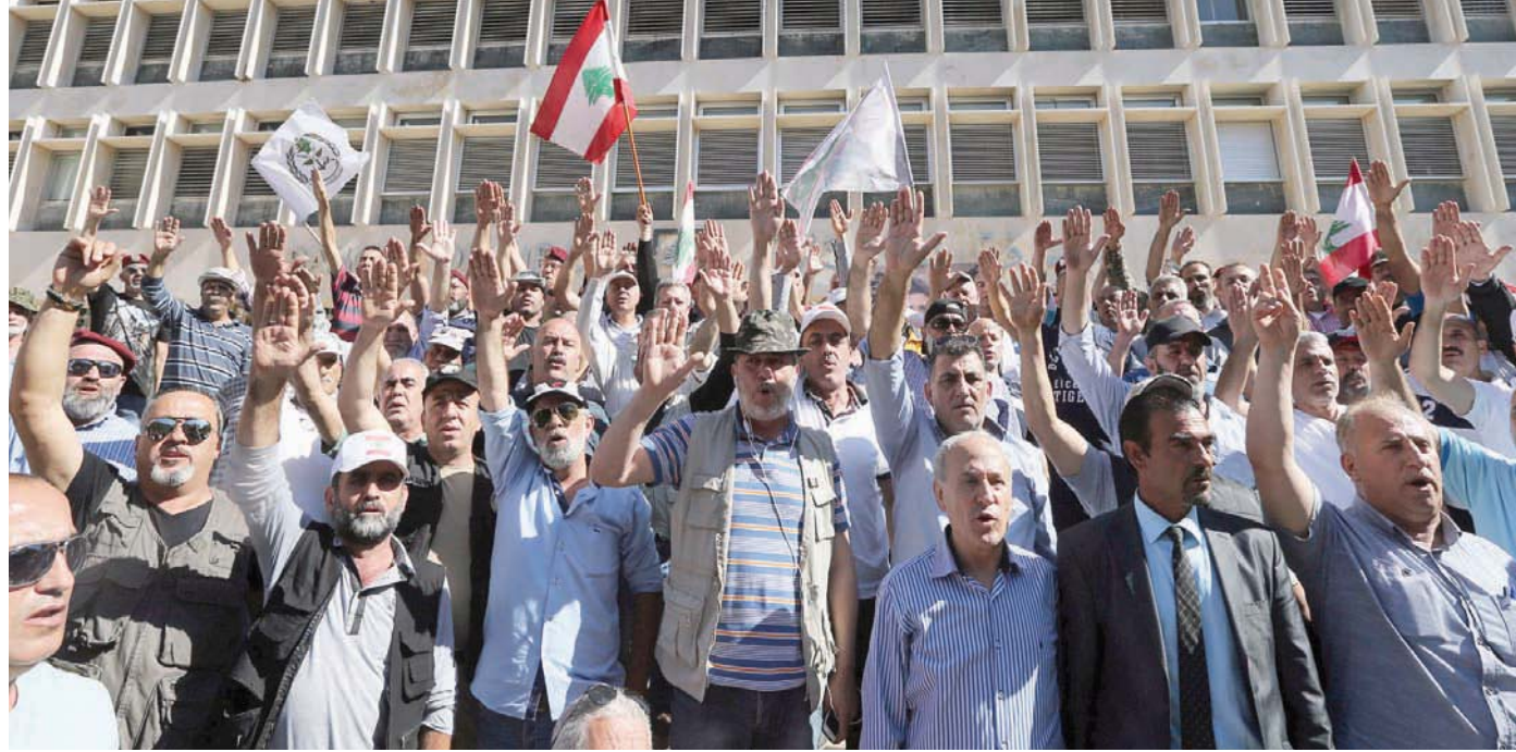
متظاهرون في تحرك سابق أمام مقر مصرف لبنان ببيروت

شهد استحقاق الشغور المرتقب في رئاسة مصرف لبنان المركزي، تحولاً مفصلاً ومثيراً قبيل ثلاثة أسابيع من انتهاء الولاية القانونية للحاكم رياض سلامة بنهاية شهر يوليو (تموز) الحالي، وحمل في طياته تلويحاً بالانغماس في مرحلة فراغ مكتمل في مركز صناعة القرار النقدي وإدارة المهام المناطة بالحاكمة وبالمجلس المركزي. فقد فوجئت الأوساط السياسية، قبل المصرفية والمالية، بصدر بيان مشترك ونادر من قبل النواب الأربعة للحاكم يشي بتصعيد لاحق في حال عدم الاستجابة لطلبهم بتعيين الحاكم. وهو ما فسره مسؤول مصرفي كبير لـ«الشرق الأوسط» بمنزلة الإنذار بالاستقالة أو الامتناع عن ممارسة مهامهم، وهو ما يمكن استنباطه من تشديدهم الجماعي على ضرورة تعيين الحاكم من قبل مجلس الوزراء، وتحت طائلة التلويح باتخاذ «الإجراء المناسب» من قبلهم.