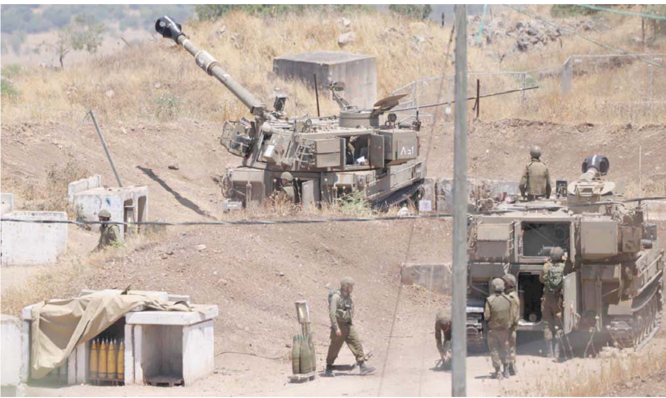
جنود إسرائيليون يجابن دباباتهم في مستوطنة «كريات شمونة» قرب الحدود مع لبنان

وقالت «الوكالة الوطنية للإعلام» الرسمية اللبنانية: إن «صاروخاً أطلق من الأراضي اللبنانية وتحدد محلها بسطرة بين كفرنشوبا والمباري في الجنوب، باتجاه الأراضي الفلسطينية المحتلة، وسقط في الأراضي اللبنانية»، لافتاً إلى أن ذلك أدى إلى «قصف مدفعي إسرائيلي استهدف خراج بلدة كفرنشوبا ومزرعة حلتا». من جهته، قال الجيش الإسرائيلي إنه «أطلق 15 قذيفة مدفعية على منطقة