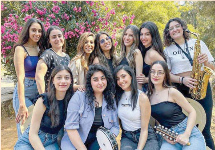
«صبايات»... فرقة من المغنيات والعازفات اللبنانيات تقدم التراث للجيل الجديد (الشرق الأوسط)