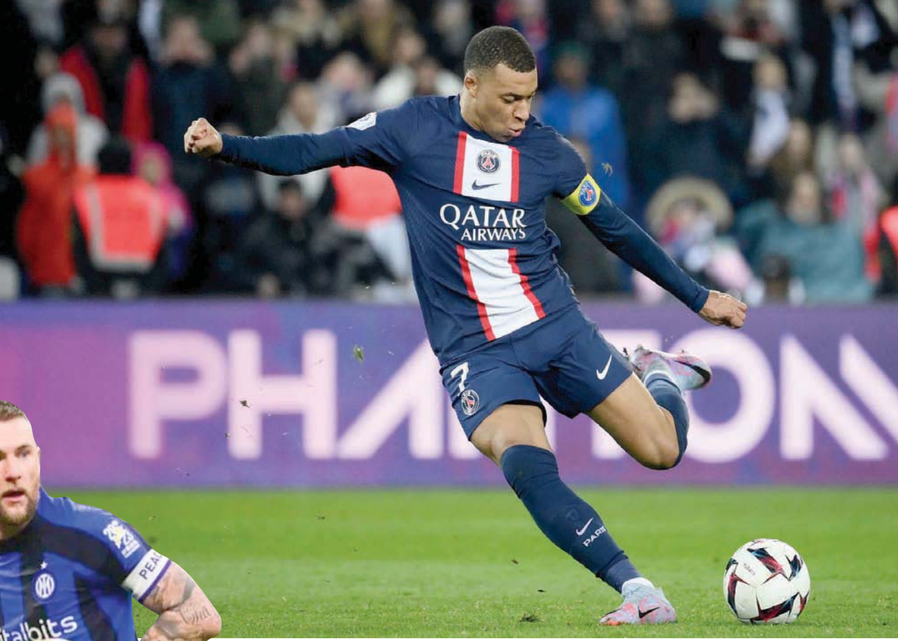
مبابي يريد استكمال عقده وسان جيرمان يريد التجديد

وضم سان جيرمان أيضاً الجناح الأيمن لنادي ريال مدريد الإسباني الدولي ماركو أسنسيو في صفقة انتقال حر وبعده يمتد حتى عام 2026. وانتقل أسنسيو البالغ من العمر 27 عاماً إلى فريق العاصمة بسجل حافل بالألقاب بعد عشر سنوات مع ريال مدريد، حيث توج مع 17 لقباً بينها دوري أبطال أوروبا ثلاث مرات، وخاض 285 مباراة سجل خلالها 61 هدفاً. وعلق أسنسيو الذي أعلن رحيله عن ريال مدريد منذ أيام عدة: «إنه لشرف كبير أن أكون جزءاً من هذا النادي الرابع الذي هو باريس سان جيرمان. أتطلع بفارغ الصبر إلى الانضمام إلى زملائي الجدد والعمل معهم لتحقيق أهداف كبيرة».