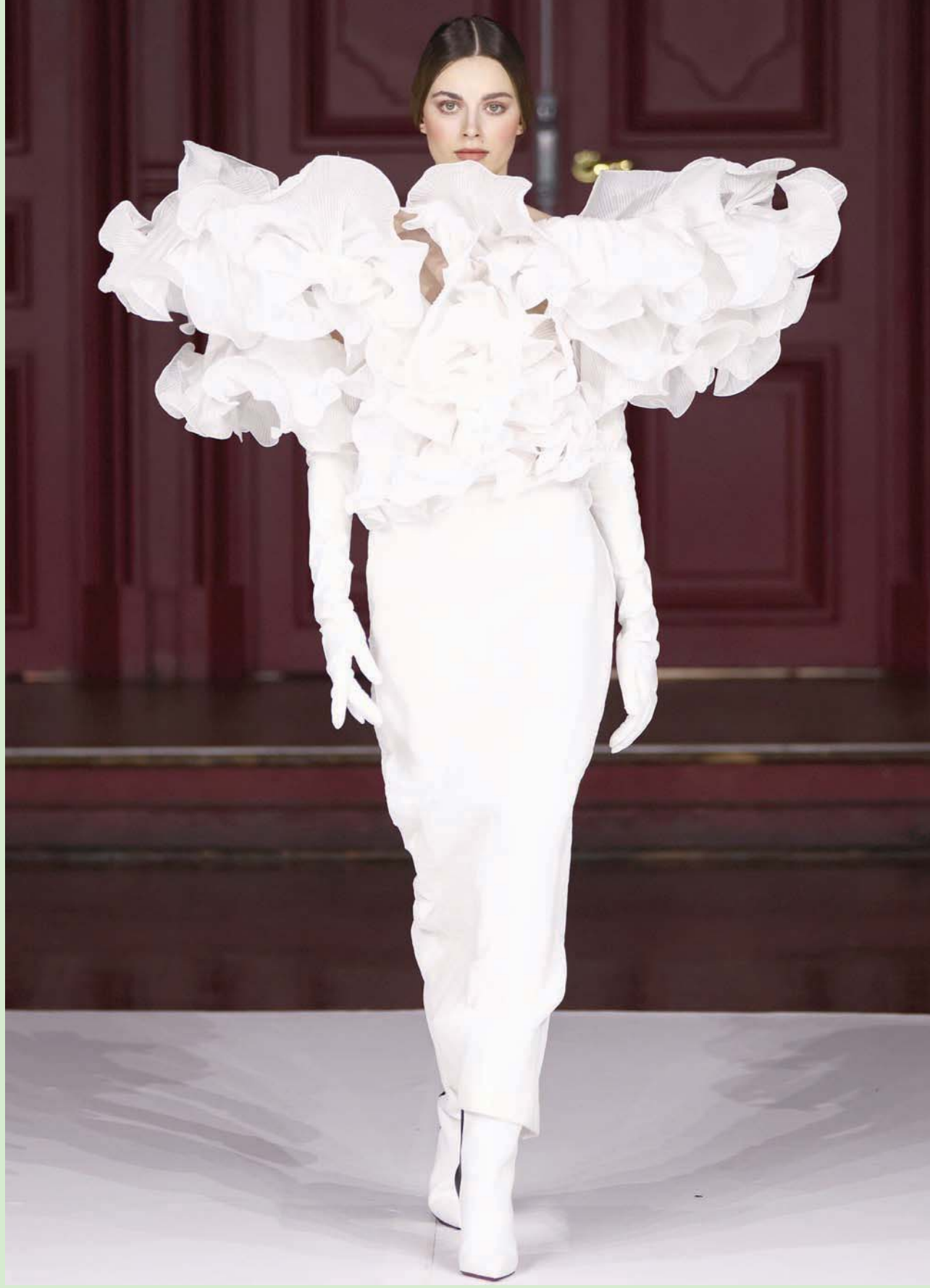
عارضة تقدم زياً للمصممة الإسبانية جوانا مارتين خلال «أسبوع الموضة» في باريس

قارن فقط بين لحظة «نائل» ولحظة «فلويد» وتتضح الحكاية.