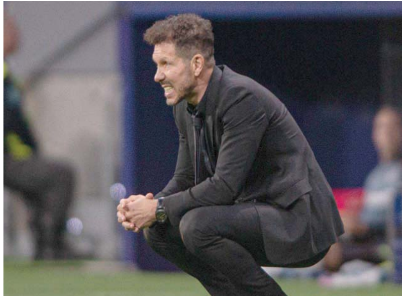
هل يكسر الأهلي علاقة تدريبيه عمرها 12 عاماً بين سيميوني وأنتيكيو مديري؟

وسبق لسبالييتي أن درب كثيراً من الأندية الإيطالية، مثل إيمبولي وسامبيوريا وأودينيزي وروما وإنتير ميلان، وحصد 3 ألقاب ورفقة روما، بواقع لقبين في «كوبا إيطاليا» ولقب في «كاس السوبر الإيطالية»، بالإضافة إلى فوزه بلقبين في الدوري الروسي رفقة زينيت سان بطرسبرغ عامي 2010 و2012.