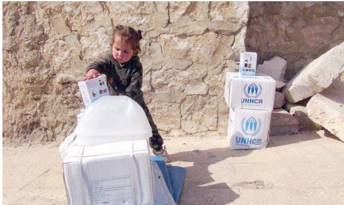
في مخيم للنازحين السوريين بالقرب من الحدود التركية (الشرق الأوسط)

حذر ناشطون في المجال الإنساني ومدبري مخيمات نازحين في شمال غربي سوريا، من تبعات قرار «برنامج الغذاء العالمي»، الذي دخل حيز التنفيذ مع بدء شهر يوليو (تموز) الحالي، في خفض مساعداته الإغاثية للسوريين، وأن يؤدي إلى تفاقم الوضع الإنساني وتعميق مأساة ملايين النازحين الذين يعتمدون في معيشتهم اليومية على المساعدات الإنسانية الأمامية بشكل رئيسي.