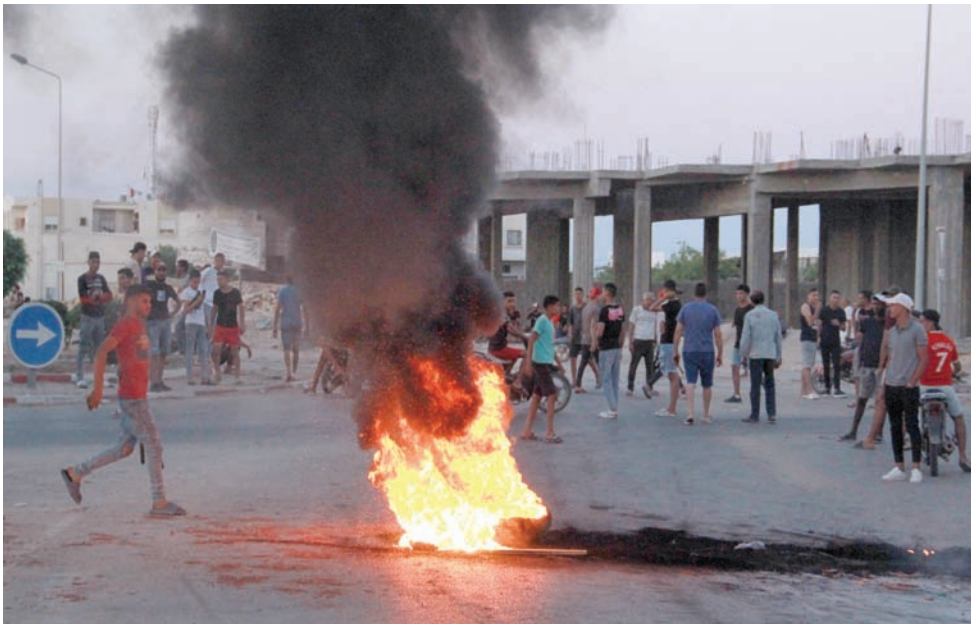
متظاهرون من أهالي صفاقس يقطعون الطريق احتجاجاً على الهجرة والمهاجرين