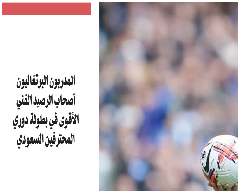
برناردو سيلفا... هل ينضم إلى الهلال السعودي؟