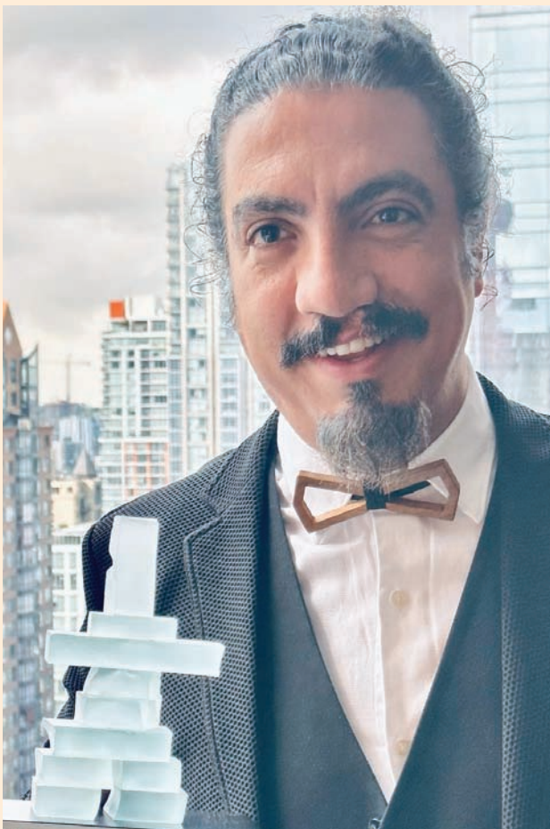
وأخيراً فايد أبي سعد سيغرف في لبنان (فيديو الفنان)

سائح، بزيادة تقارب 20 في المائة عن العام الماضي، غالبيةهم من المغتربين اللبنانيين، مما يدل روحانا وغيرهم. وسيختتم كما اللبانيين في الخارج ببلدهم وحبه لهم، هو دعم كبير ومتواصل. ولغت أيضاً إلى أن عدد الوافدين خلال الصيف يوازي عدد السياح عام 2018، أي ما قبل الأزمة، وهي إشارة غاية في الإيجابية.