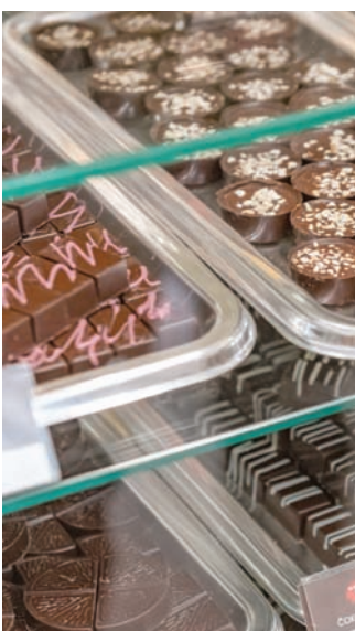
من أشهر محال الشوكولاته في المدينة

نفاذهما على جدران القصر. وكان مطعم ومقهى «كافانا» بالفندق مركزاً ثقافياً لقرون عدة. الغرفة المزدوجة بسعر 105 يورو. * بالنسبة للإيجار قصير الأجل، يقع حي فاروش بين المركز وشبه جزيرة مارجان. تعدّ فيلات «باكفيش» مثالية للوصول إلى الشاطئ. وتعد «توش» مشية لمدة خمس دقائق إلى «ريفا» وخلف ميناء العبارات الرئيسي. التجوال * سبليت هي مدينة للمشي؛ تقريباً كل موقع جذب عبارة عن نزهة قريبة ومسوحة. فالحافلات يمكن الاعتماد عليها، وتشكل سيارات الأجرة التقليدية، فضلاً عن خدمات ركوب السيارات، مثل «أوبر» و«بولت»، اختيارات جذيرة بالثقة.