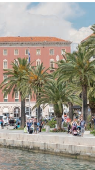
مقصد محبي الشواطئ بأسعار لا تزال مقبولة (نيويورك تايمز)

* تقدم شركة «اند أفنتشر» السياحية رحلات الإبحار من ميناء سبليت وتشتمل وجبة طعام. * تحتل قلعة «كليس»، المعروفة باسم «مفتاح دالماتيا»، موقعاً استراتيجياً يحمي سبليت والمناطق المحيطة بها طوال آلاف السنين. * كانت «سالونا» واحدة من كبرى المدن في الإمبراطورية الرومانية. واليوم، هي عبارة عن متحف في الهواء الطلق مليء والمسرح المدرج. * ربما يكون شاطئ «باكفيش» أشهر شاطئ في سبليت. وهو أيضاً مكان مفضل للعائلات والسكان المحليين النشطين؛ نظراً لرماله ومياهه الضحلة. * تقع سوق «بازار»، السوق الخضراء في الهواء الطلق، إلى جانب