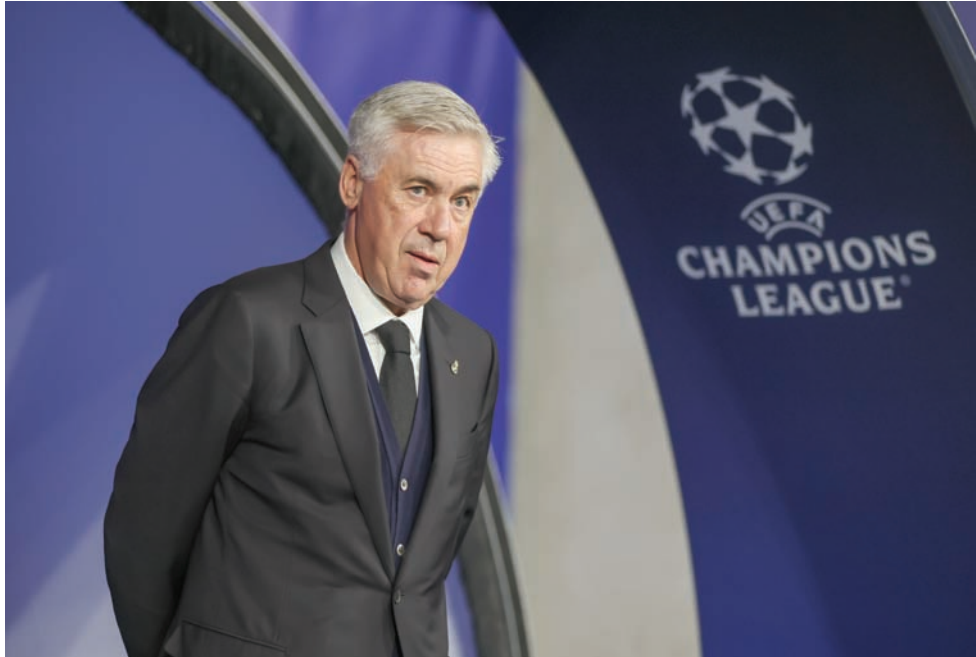
أنشيلوتي سيكسر القاعدة ويصبح أول أجنبي حقيقي يقود البرازيل (د.ب.أ)

الصحافي المستقل رومان مولينا ثم «راديو مونت كارلو سبورتس» رسالة إلكترونية منسوبة إلى المدير الرياضي السابق لنيس جوليان فورنييه زعم فيها أن غالتيه أدلى بتصريحات تمييزية تجاه قسم من فريق نيس. وذكر فورنييه بشكل خاص هذه الملاحظات المنسوبة إلى غالتيه: «ثم أجاب بأنه كان عليّ أن أخذ في الاعتبار حقيقة المدينة، وأنه في الواقع لا يمكن أن يكون لدينا هذا العدد من الفريق أو إدارته».