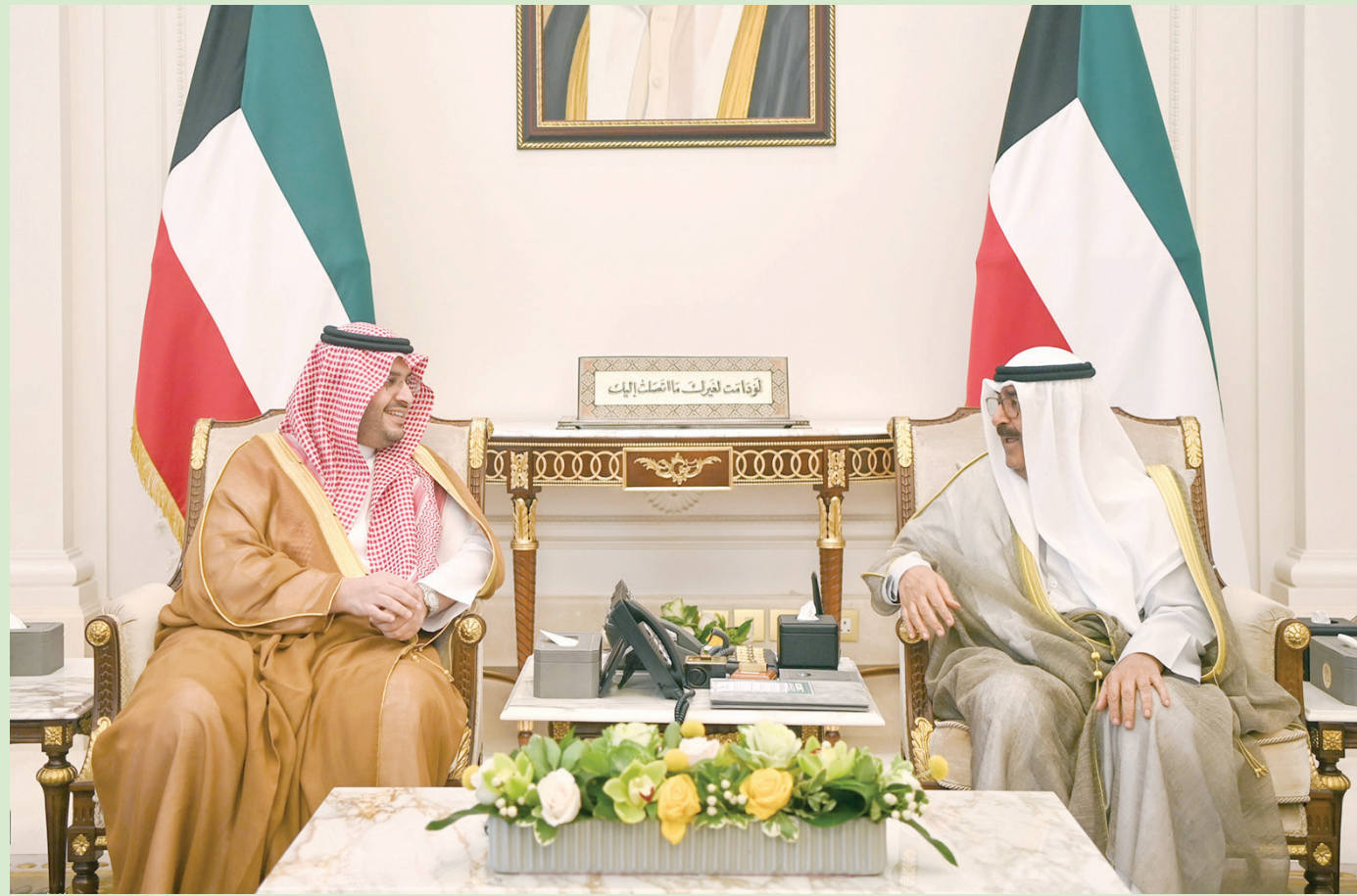
ولي العهد الكويتي لدى استقباله الأمير تركي بن محمد بن فهد وزير الدولة عضو مجلس الوزراء السعودي (كويتا)

في سياق متصل، التقى الأمير تركي بن محمد بن فهد، الشيخ أحمد نواف الأحمد الصباح رئيس الوزراء الكويتي، والشيخ طلال خالد الأحمد الصباح النائب الأول لرئيس مجلس الوزراء وزير الداخلية، والشيخ أحمد فهد الأحمد الصباح نائب رئيس مجلس الوزراء وزير الدفاع، كلاً على حدة، وجرى تبادل الأحاديث الأخوية والعلاقات الثنائية المتميزة بين البلدين وسبل تطويرها.