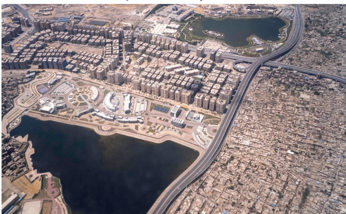
منظر جوي لعمليات بناء في منطقة تقع جنوب متحف الحضارات وقرب مدافن تاريخية بالقاهرة القديمة في أبريل الماضي

وتستعد وزارة الإسكان، لطرح نحو ألفي وحدة سكنية جديدة للبيع، خلال الفترة المقبلة، بالإضافة إلى افتتاح فندق، و«مول» تجاري؛ ما يستلزم ربط الطرق الرئيسية