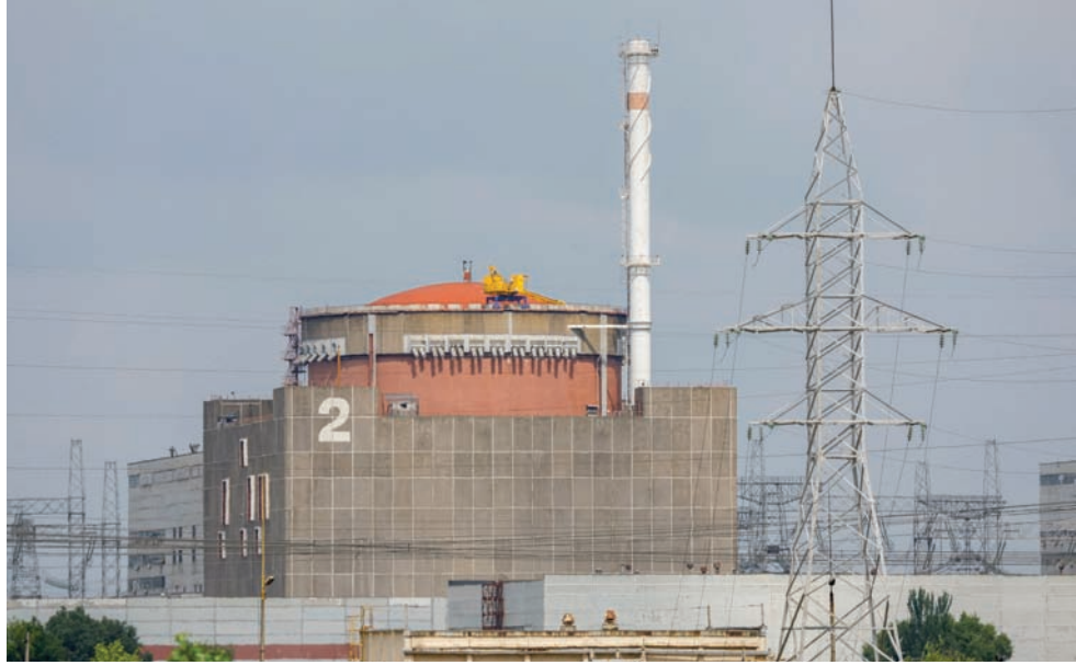
محطة زابوريجيا النووية

تبادلت موسكو وكييف الاتهامات بالإعداد لنش هجوم وشيك على محطة زابوريجيا للطاقة النووية في جنوب أوكرانيا في كارثة قد تنتشر التلوث الإشعاعي على مساحة كبيرة من القارة وتحتوي على ستة مفاعلات. وقال الرئيس الأوكراني فولوديمير زيلينسكي إن جهاز استخباراته تلقى معلومات «تفيد بأن الجيش الروسي وضع أشياء تشبه المتفجرات على أسطح العديد من وحدات المفاعل». وبدوره حذر الكرملين أمس الأربعاء من «عمل تخريبي» أوكراني محتمل تكون دواعياته «كارثية» على المحطة. وقال دميتري بيسكوف المتحدث باسم الكرملين للصحافيين إن تبعات أي تخريب للمحطة النووية قد تكون كارثية. وقال بيسكوف، كما نقلت عنه «رويترز»: «الوضع يشوبه حالة من التوتر الشديد لأن هناك بالفعل تهديداً بنوع من التخريب من جانب نظام كريف، وقد يسفر ذلك عن عواقب قد تكون كارثية». وتابع قائلا: «أوضح نظام كريف مرارا استعدادة لفعل أي شيء، لذلك جرى اتخاذ كل الإجراءات اللازمة للتصدي لهذا التهديد». ولم يقدم دليلاً يدعم تأكيد وجود تهديد أوكراني.