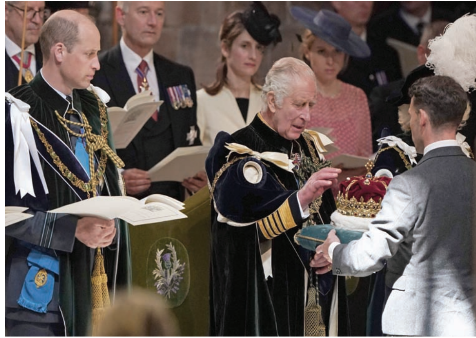
خلال تقديم التاج للملك تشارلز