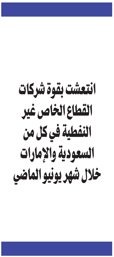
نمو اقتصادي في السعودية مقارنة بمجموعة العشرين» (واس)

وطبقاً للعبيدي، ستعطي الاستثمارات المدعومة من الحكومة خاصة مشروعات