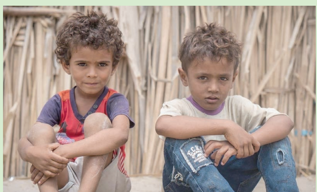
نسب عدم كفاية الغذاء عادت إلى مستويات ما قبل شهر رمضان الماضي

وذكر أنه، وبسبب النقص الحاد والمستمر في التمويل، اضطر البرنامج إلى تحويل أكثر من 900 ألف مستفيد من المساعدات الغذائية القائمة على النقد، إلى المساعدات الغذائية العينية، وقال