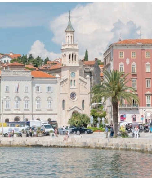
مقصد محبي الشواطئ بأسعار لا تزال مقبولة (نيويورك تايمز)

* تعدّ «فيلا سبيرا» مطعماً يقع في المركز التاريخي، ويصنع قائمة طعام جديدة وأطباق جديدة تعتمد على المكونات الطازجة كل يوم. * «شيفيس تيبيل» هي تجربة حديثة لتناول الطعام تأخذ الضيوف في رحلة دالماتية. * «سول» هي صالة جديدة مع شرفة مطلة على الفناء، وأجواء مريحة. * «باراكا باربيكيو» و«بريو بار» يقدمان عروض موسيقى البلوز والروك. * «دوجكين دفور»، هو مطعم قبالة ميناء الصيادين. * مطعم «تيراكا فاديلكا»، الذي يقدم الطعام والمشروبات، يمكن القول إنه أفضل شرفة في المدينة مع إطلالة بانورامية على سبليت.