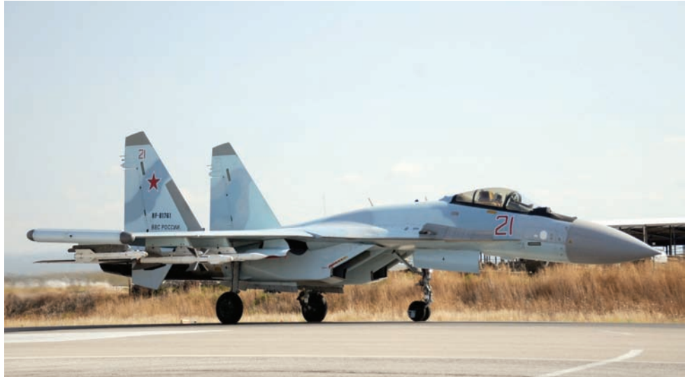
مقاتلة روسية بقاعدة «حميميم» قرب اللاذقية (أ.ف.ب)

العسكري الروسي من أن «طباري سلاح الجو الأميركي قاموا مرتين بتفعيل منظومات الأسلحة لديهم عند اقترابهم من الطائرات الروسية»، في تطور غير مسبق منذ اتفاق الطرفين في 2015 على اليات لمواجهة وقوع احتكاكات غير مقصودة في مواقع نشاط قوات البلدين. وبحسب قوله، فإن الجانب الروسي يعمل على تثبيت الانتهاكات المنهجية والخطيرة لبروتوكولات عدم التصارب والمذكرة الثنائية لسلامة الطيران في سوريا من قبل التحالف الذي تقوده الولايات المتحدة.