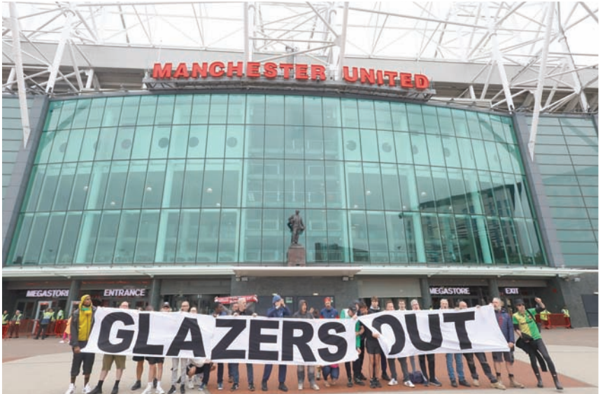
جماهير يونايتد تتظاهر خارج «أولد ترافورد» مطالبة بخروج عائلة غليزر

امتناني لكل دعمكم على مدار الـ18 عاماً الماضية. أعرف أن بعضكم لن يكون سعيداً بقراري، لكن هذا هو القرار المناسب لي في هذه اللحظة من مسيرتي. انضمت إلى تشيلسي عندما كنت في السادسة من عمري وقد مررت بالكثير من أعوام.