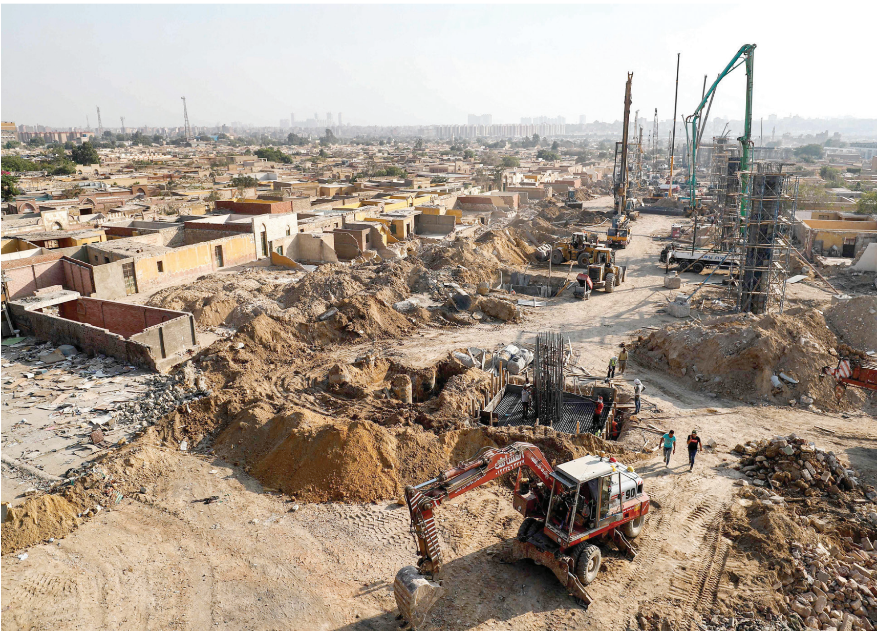
عمليات حفر لتشييد طريق قرب مدافن بجنوب القاهرة القديمة في يوليو 2020

ويشهد إقليم القاهرة الكبرى كثافة سكانية كبيرة، تستلزم شق طرق وجسور جديدة، للقضاء على