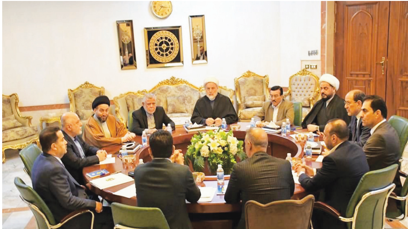
قوى «الإطار التنسيقي» خلال أحد اجتماعاتها بحضور السوداني في فبراير الماضي (و.ع)

أمر رئيس الوزراء والقائد العام للقوات المسلحة العراقي محمد شياع السوداني، يوم الأربعاء، بإجراء تغييرات جذرية عديدة على مناصب كبار المسؤولين في جهاز الأمن الوطني والمخابرات. وقال الناطق باسم القائد العام، اللواء جحبي رسول، في بيان إنه «عملاً بالبرنامج الحكومي وأولوياته المتعلقة بالإصلاح الإداري للمؤسسات الأمنية، أصدر القائد العام للقوات المسلحة محمد شياع السوداني، وأمر بتغييرات في بعض المواقع الأمنية». وجاءت الخطوة بحسب رسول «بهدف ضخ دماء جديدة وإعطاء الفرصة لقيادات أخرى في إدارة الملف الأمني من أجل رفع كفاءة الأداء للمؤسسات الأمنية». وأضاف أن «هذه الخطوة تأتي بعد دراسة مستفيضة لتعزيز الأمن والاستقرار في مختلف مناطق البلاد، ولتقطيعات المصلحة العامة، التي تتطلب العمل وفق رؤية مهنية بقيادات أمنية جديدة تنسجم بالكفاءة، وتدرجت في الخدمة داخل المؤسسات الأمنية، وسيخضع عملها أيضاً للتقييم المستمر». ونقن السوداني «الجهود التي بذلتها القيادات التي شملها التغيير خلال مدة تسلمها المنصب، وقدمت ما نستطيع تقديمه في مواقع المسؤولية»، طبقاً للبيان.