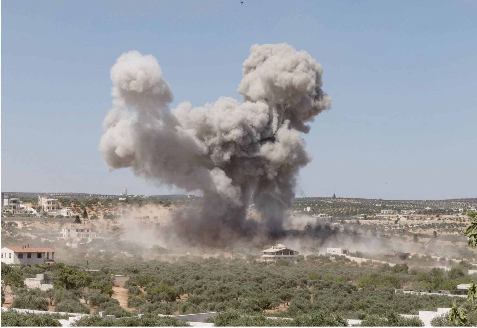
دخان عقب غارة روسية على ضواحي جسر الشغور بمحافظة إدلب في 25 يونيو الماضي

وأضاف غورينوف أنه «تم خلال يوم واحد تسجيل تسع حالات انتهاك فوق مناطق شمال سوريا من قبل طائرات دون طيار تابعة للتحالف الدولي بقيادة الولايات المتحدة». وأكد أن «زيادة عدد الطلعات الجوية غير المنسقة تؤدي إلى تصعيد التوتر، ولا تساهم في