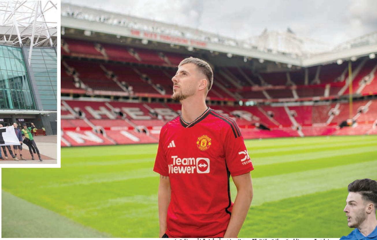
ماونت يقيم مانشستر يونايتد خلال تقديمه للجماهير في أولد ترافورد

وظهر ماونت في ملعب يونايتد مرتدياً القميص الأحمر رقم 7 الذي سبق وارتداه كل من الأسطورتين البرتغالي كريستيانو رونالدو والدولي السابق ديفيد بيكام. ووفق التقارير، فإن يونايتد دفع 55 مليون جنيه إسترليني (69 مليون دولار) مقابل ماونت، مع خمسة ملايين إضافية ستدفع إلى تشيلسي بوصفها