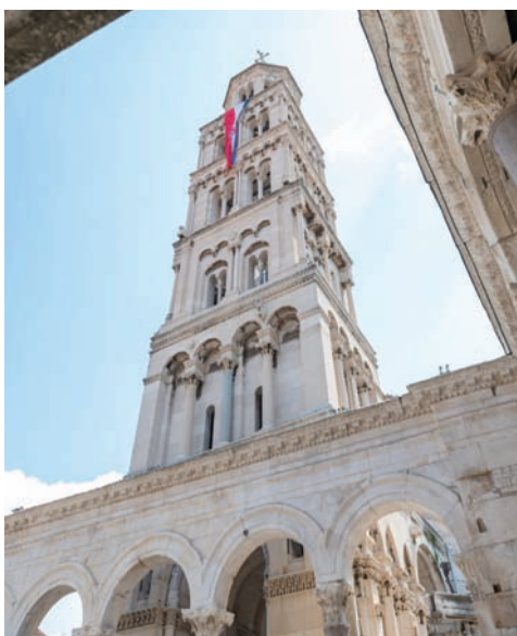
سبليت غنية بالتراث والمباني التاريخية

* تعدّ «فيلا سبيرا» مطعماً يقع في المركز التاريخي، ويصنع قائمة طعام جديدة وأطباق جديدة تعتمد على المكونات الطازجة كل يوم. * «شيفيس تيبيل» هي تجربة حديثة لتناول الطعام تأخذ الضيوف في رحلة دالماتية. * «سول» هي صالة جديدة مع شرفة مطلة على الفناء، وأجواء مريحة. * «باراكا باربيكيو» و«بريو بار» يقدمان عروض موسيقى البلوز والروك. * «دوجكين دفور»، هو مطعم قبالة ميناء الصيادين. * مطعم «تيراكا فاديلكا»، الذي يقدم الطعام والمشروبات، يمكن القول إنه أفضل شرفة في المدينة مع إطلالة بانورامية على سبليت.