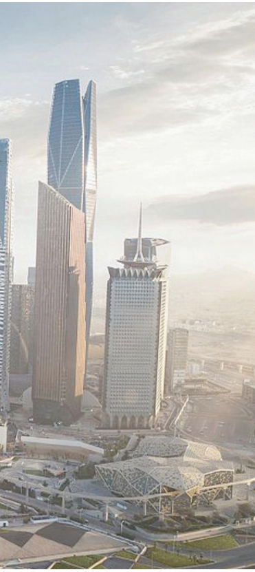
نمو اقتصادي في السعودية مقارنة بمجموعة العشرين» (واس)

وقال الغيث: «في نهاية المطاف تظل الاستثمارات المدعومة من الحكومة وخاصة في مشروعات البناء البنية التحتية ضرورية