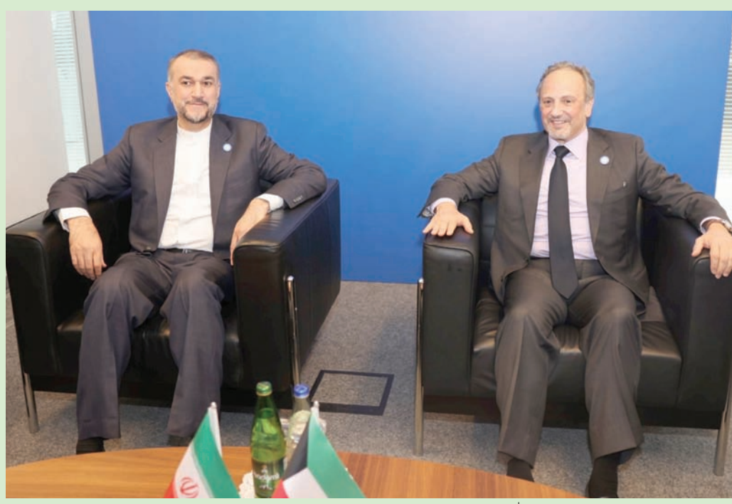
وزير الخارجية الكويتي الشيخ سالم عبد الله الجابر الصباح والإيراني حسين أمير عبداللهيان على هامش الاجتماع الوزاري لحركة عدم الانحياز في باكو

وشدد المصدر، خلال تصريح أدلى به لوكالة الأنباء السعودية في أعقاب ما تم تداوله مؤخراً حول حقل «الدرة»، على أن السعودية والكويت وحدهما كامل الحقوق السيادية لاستغلال الثروات في تلك المنطقة. وأضاف أن السعودية تجدد دعواتها السابقة لإيران للبدء في مفاوضات لترسيم الحد الشرقي للمنطقة المغرورة المقسومة بين السعودية والكويت كطرف تفاوضي واحد مقابل الجانب الإيراني، وفقاً لأحكام القانون الدولي.