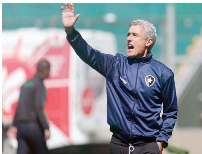
لويس كاسترو اتفق مع النصر مبدئياً

ويمكن أن يزداد هذا العدد خلال الفترة المقبلة وحتى مع بدء منافسات الموسم الجديد، خصوصاً مع الخبرة العريضة التي