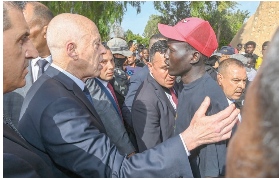
الرئيس التونسي قيس سعيد يتحدث مع مهاجر أفرقي خلال زيارته صفاقس في 10 يونيو الماضي