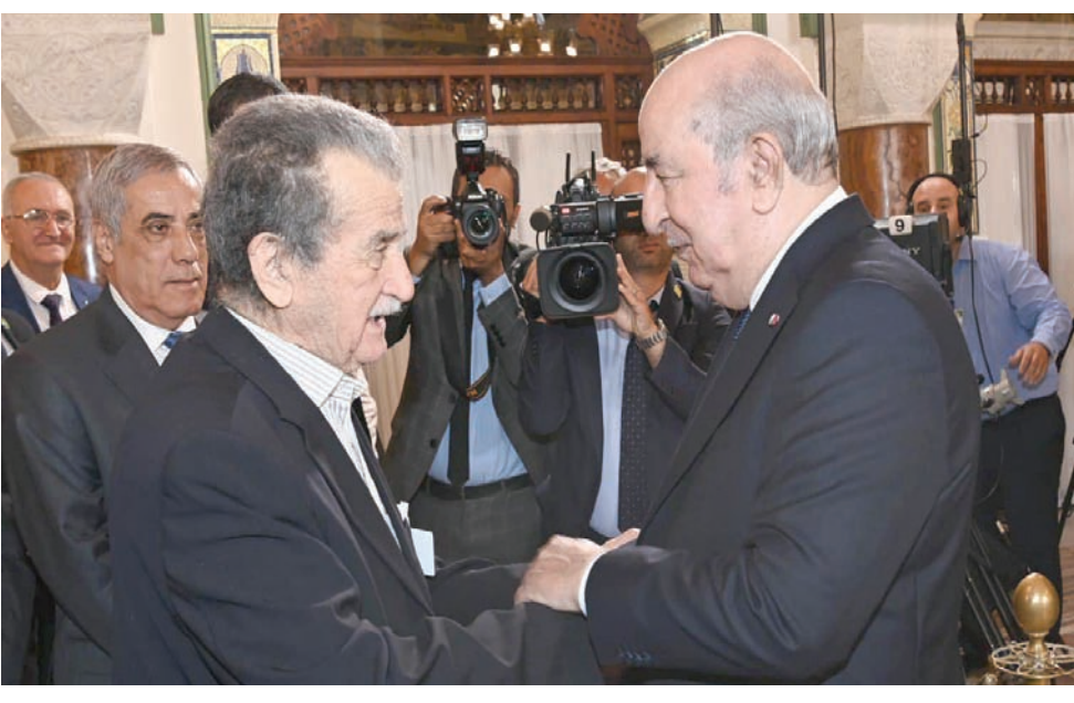
الرئيس تبون مع إحدى أيقونات ثورة التحرير يوسف الخطيب (الرئاسة)

المخدرات وجرائم الفساد واختلاس المال العام، وعبر ناشطون إسلاميون، بحساباتهم بالإعلام الاجتماعي، عن خيبتهم لعدم الإفراج عن نحو 200 شخص، يقضون فترات طويلة في السجن منذ بداية تسعينات القرن الماضي، بتهمته الإرهاب. ويرى المدافعون عنهم، أنهم سجناء سياسيون على أساس اتهامهم لحزب «جبهة الإنقاذ» الإسلامي المحظور. ونزل الرئيس تبون اليوم إلى بعض المناطق، لتدشين بعض المشروعات بعد إتمام إنجازها، من بينها مستشفى متخصص في الحروق بالضاحية الغربية للعاصمة، ومحطة لتحلية مياه البحر بموردراس (50 كلم شرق). وكان أشرف على ترقية مئات الضباط إلى مختلف الرتب. وتلقى تبون بالمناسبة، التهاني من خادم الحرمين الشريفين الملك