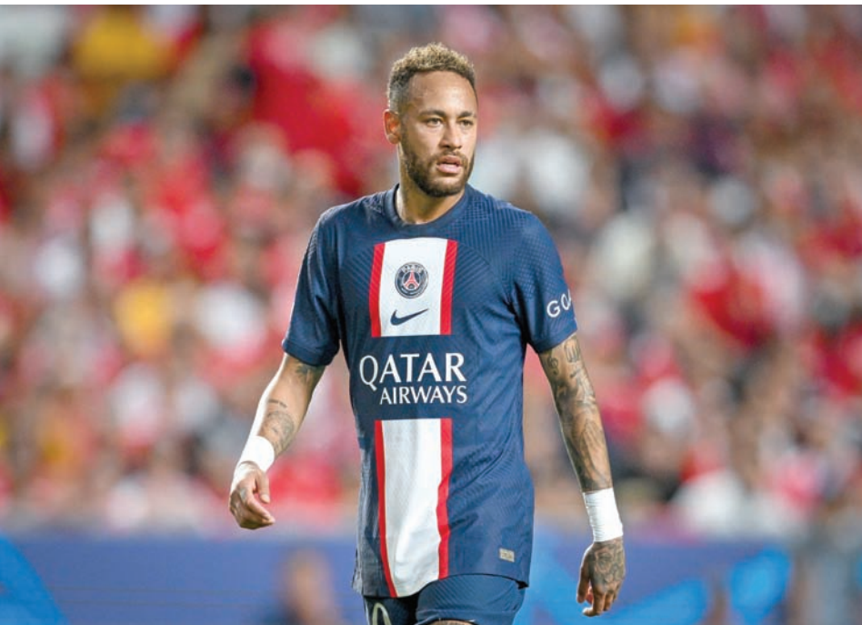
نيمار (باريس سان جيرمان)

بعد رحيل المهاجم النيجيري أودوين إيفالو، بات ضرورياً على الزعيم الهلالي دعم خط هجومه، فالتجهت الأنظار نحو البرازيل، وتحديدًا ناحية المهاجم بيدرو، مهاجم نادي فلانغو البرازيلي، حيث قالت صحيفة «بول» البرازيلية إن الهلال عرض على اللاعب راتباً قياسياً ربما يتجاوز ستة أضعاف ما يتقاضاه في فلانغو. ورغم أن اللاعب لم يبد موافقته حتى الآن، فإن الهلال على ما