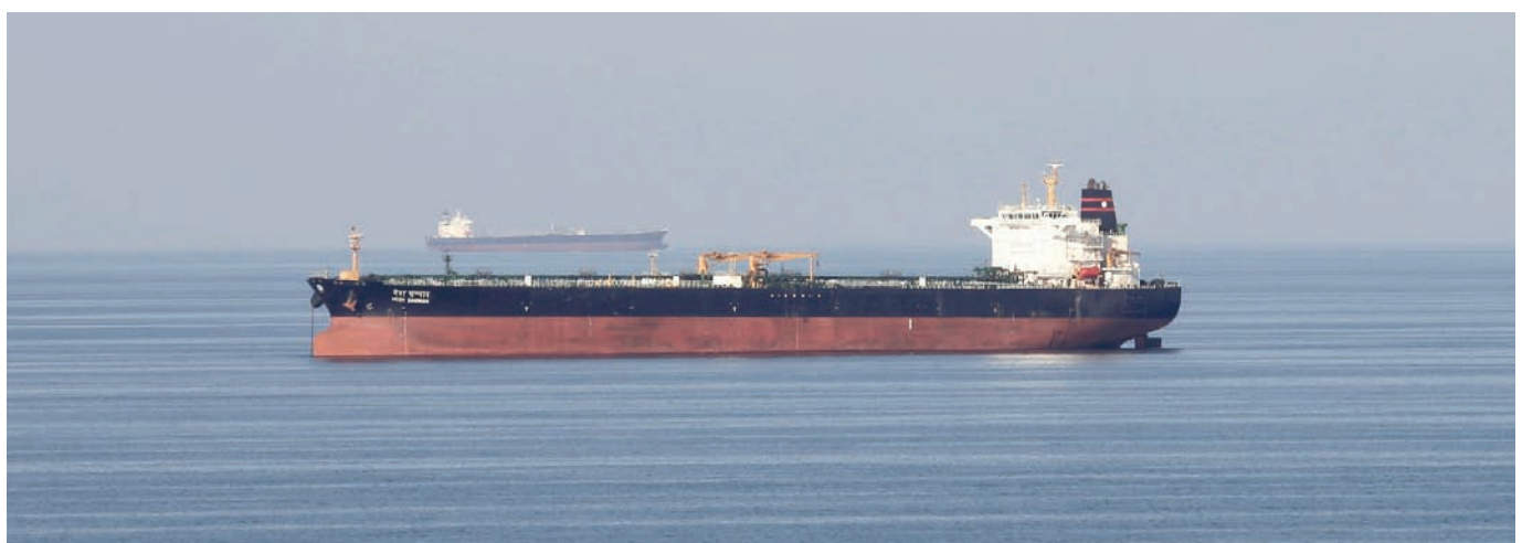
صورة أرشيفية لناقلة نفط خلال عبورها مضيق هرمز

وأشارت البحرية الأميركية إلى أن إيران احتجزت خمس سفن تجارية على الأقل في العامين الماضيين وضابقت عدة سفن أخرى وأوضحت أن العديد من الحوادث وقعت عند مضيق هرمز، الذي يمر عبره 20 في المائة من إجمالي النفط الخام. والمحنت البحرية الأميركية إلى أن إيران تستخدم هذا الأسلوب وتقوم بمصادرة سفن تجارية لاستخدامها كقوة مساومة مع الغرب. ومنذ عام 2019 وقعت العديد من حوادث الهجمات