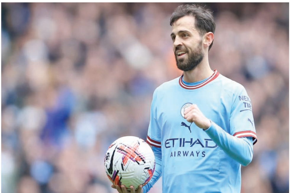
نونو سانتو (مانشستر سيتي)

مواطنه نونو سانتو، بعد تالقه اللافت في الملاعب الأوروبية خلال آخر موسمين.