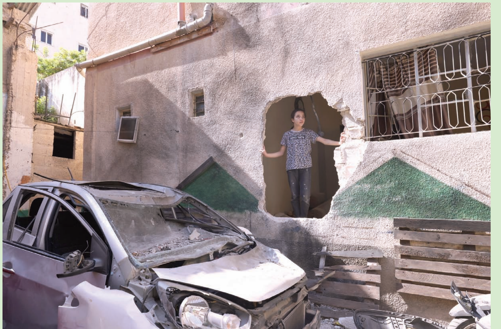
ملفلة في منزل تهدم أحد جدرانها بعد انتهاء العملية العسكرية الإسرائيلية في جنين أمس