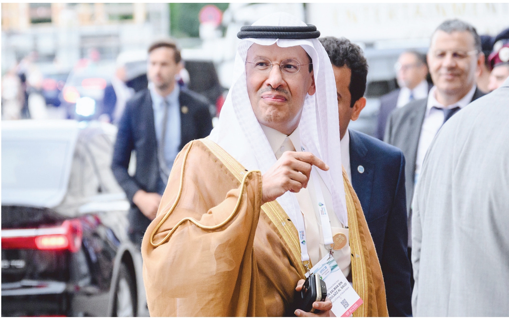
الأمير عبد العزيز بن سلمان وزير الطاقة السعودي لدى وصوله إلى مؤتمر «أوبك» الدولي الثامن في فيينا

وأكد أن الدول المنتجة للنفط أكثر دراية بهذه السوق من المضاربين والتجار، وقال: «نحاول عكس الصورة الواقعية لتوازن الطلب مع العرض من خلال البيانات والأرقام الصادرة عن مصادر مستقلة بما يعطي مصداقية وتوازناً في اتخاذ القرارات». وأضاف أن دولة الإمارات من المضاربين الكبار في تحالف «أوبك بلس» وتلعب دوراً مهماً في دعم جهود المنظمة والقرارات الصادرة عنها والذي يخدم 8 مليارات شخص حول العالم اعتماداً على النفط والغاز مع الالتزام بالخفض الطوعي لإنتاج النفط والذي يتعكس على استقرار السوق. ويبلغ إجمالي تخفيضات الإنتاج حالياً أكثر من 5 ملايين برميل يوميا أو ما يعادل 5 في المائة من مجمل إنتاج