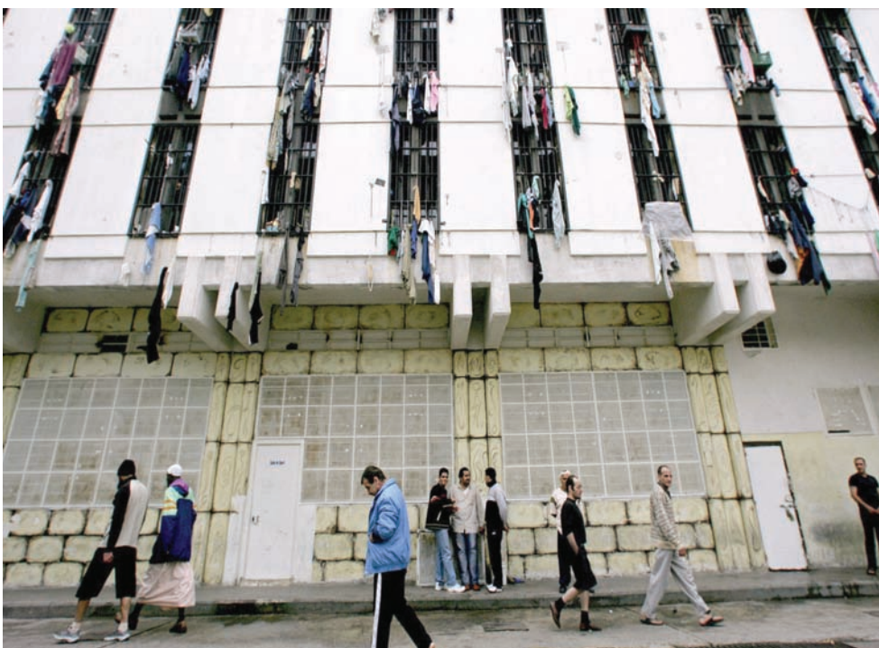
سجن رومية أحد أكثر السجون اكتظاظاً في لبنان

وكتب عبر حسابه على «توتير»: «في سجن رومية وبعض السجون الأخرى ومراكز التوقيف بات من الصعب سوق المتهمين إلى القضاء للتحقيق بسبب الصعوبات اللوجستية والمالية التي تعاني منها المؤسسات الأمنية (عدم توفر البات)»، وأضاف: «هذه كارثة جديدة تضاف إلى ما تشهد السجون من مخاطر حوّلتها إلى قنابل موقوتة»، وشدد على أنه «على المعنيين