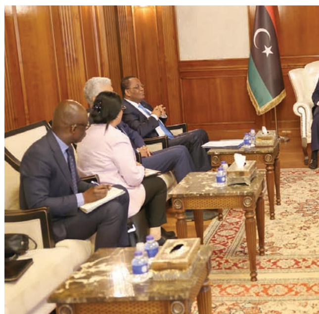
من لقاء الدببة مع وفد الاتحاد الأفريقي بطرابلس (حكومة الوحدة)

خلال العام الجاري، وضرورة أن يشمل ذلك مؤسسات الدولة كافة دون استثناء. وشدد على «ضرورة الاهتمام بالمواطنين، وتقديم الخدمات لهم». وادعى أن «ما يزيد عن 80 في المائة من الميزانية يذهب للمواطنين بشكل مباشر». كما أعلن الاتفاق على التنسيق بين وزارتي المالية والخطيط والمصرف لحرص كل المصروفات بشكل تفصيلي، ليعرف المواطنون أين تذهب المخصصات المالية. وبدوره، أدرج الكبير لقاءه مع فرحات بن قدارة، رئيس المؤسسة الوطنية للنفط، في إطار التواصل المستمر لدعم جهود المؤسسة للمساهمة في زيادة إنتاج النفط والغاز واستقراره. وكان الدببة قد دعا وفد اللجنة رفيع المستوى للاتحاد الأفريقي المعنية بليبيا بقيادة وزير خارجة الكونغو جون كاغوسو، الذي التقاه مساء الثلاثاء إلى «العمل عن قرب من داخل ليبيا والتواصل مع كافة شرائح المجتمع». ومن جهته، شدد رئيس مجلس الدولة، خالد المشري، لدى اجتماعه بالوفد الأفريقي على «ضرورة التعجيل والإسراع بملف المصالحة الوطنية، وتوسيع دائرة التواصل لتشمل كل الأطراف الليبية من أجل التوصل لحلول شاملة للأزمة وإجراء انتخابات ناجحة تنهي المراحل الانتقالية وتصل بالبلاد، مرحلة الاستقرار الدائم».