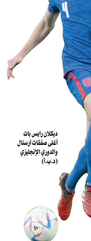
ديكلان رايس بات أعلى صفقات أرسنال والدوري الإنجليزي (دي.ب.أ)

وظهر ماونت في ملعب يونايتد مرتدياً القميص الأحمر رقم 7 الذي سبق وارتداه كل من الأسطورتين البرتغالي كريستيانو رونالدو والدولي السابق ديفيد بيكام. ووفق التقارير، فإن يونايتد دفع 55 مليون جنيه إسترليني (69 مليون دولار) مقابل ماونت، مع خمسة ملايين إضافية ستدفع إلى تشيلسي بوصفها