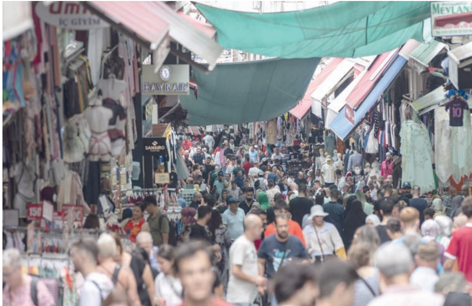
أسواق تركيا شهدت ازدياداً في عيد الأضحى رغم ارتفاع الأسعار

وسجل التضخم السنوي تراجعاً للشهر الثامن على التوالي بعدما وصل إلى ذروته في أكتوبر (تشرين الأول) من العام الماضي عند مستوى 85,4 في المائة، الذي كان الأعلى منذ ما يقرب من ربع قرن في ظل إصرار إردوغان على خفض سعر الفائدة على اعتبار أن الفائدة المرتفعة في السبب في التضخم المرتفع. وسجل التضخم السنوي في مايو (أيار) الماضي معدلاً بلغ نحو 39,5