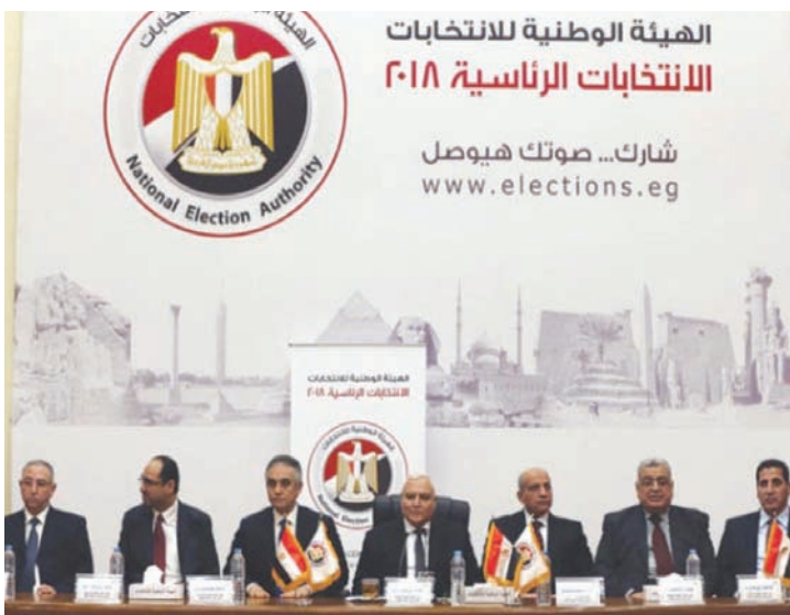
«الهيئة الوطنية للانتخابات» بصر خلال إعلان نتائج الانتخابات الرئاسية عام 2018 (إ.ب.أ)

وقررت الهيئة، في اجتماعها، (الأربعاء)، تكليف الجهاز التنفيذي لها بـ«مراجعة القرارات الإدارية والتنظيمية السابق صدورها، وتفعيلها، وإعداد تقرير مفصل عنها، والاستمرار في إجراءات تنقيح قاعدة بيانات الناخبين وتحديثها»، وتطرق الاجتماع إلى عدد من التصورات المتعلقة بالاستحقاقات الانتخابية، في «إطار العمل على بلورة استراتيجية واضحة لإدارة الاستحقاقات المقبلة»، ومن ثم تكليف الجهاز التنفيذي «العمل على تنفيذها بشكل فُصل، بما ينعكس إيجاباً على مسار مختلف العمليات الانتخابية، وبحقق أهدافها ويتلافى أي مشكلات سابقة».