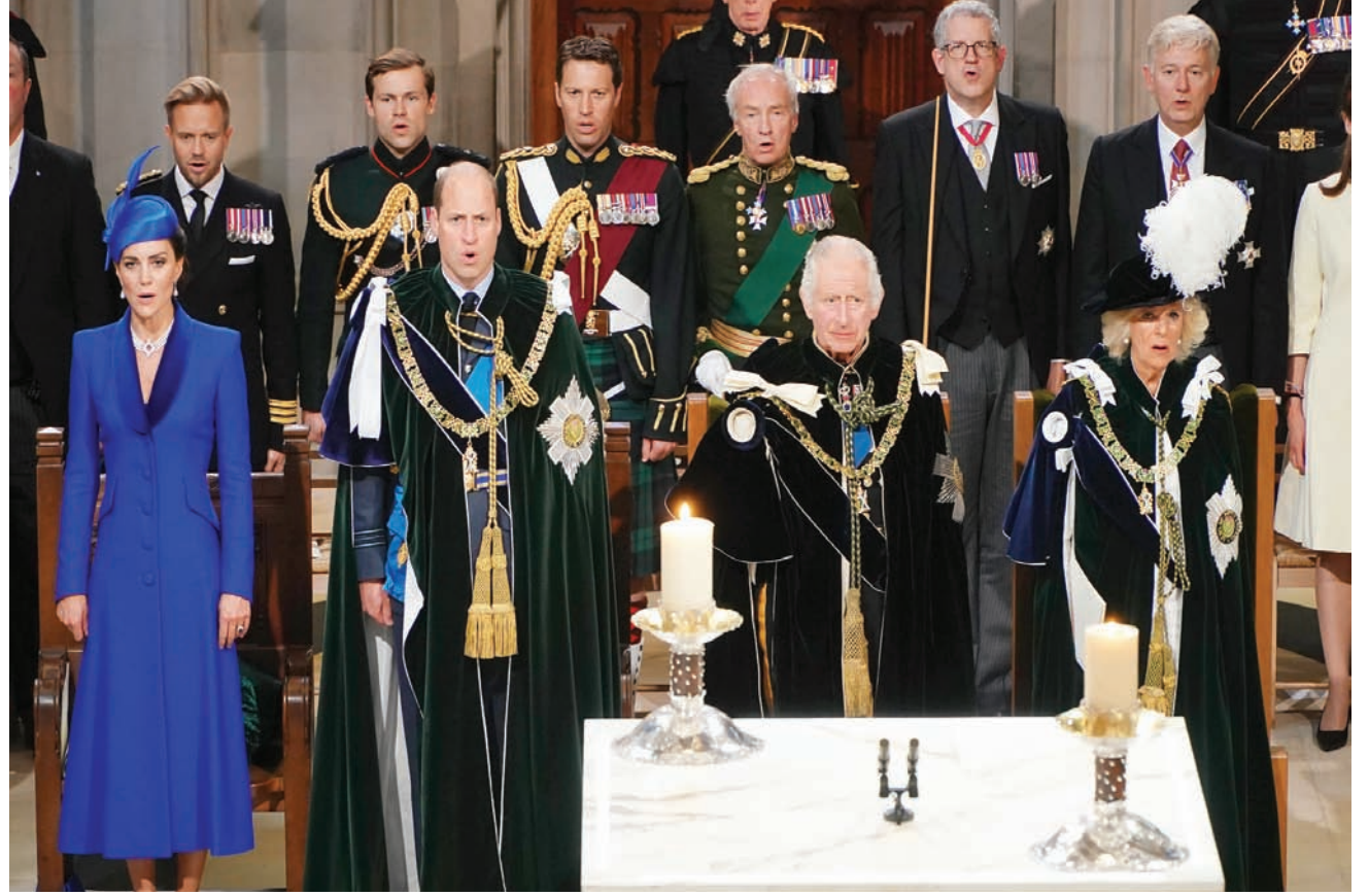
الملك تشارلز والملكة كاميليا مع الأمير ويليام وزوجته كاترين في كاتدرائية سانت غايلز بإدنبره

وفي حفل ما قبل الختام يوم 11 أغسطس أمسية تحمل عنوان «أصل الموسيقى» تقدمها الأخت مارانا سعد، وتستضيف فيها الفنانة كارلا راميا، مع جوقة «فيلوكاليا» وفرقة «عشتار» للغناء. وشرح سعد خلال المؤتمر أنها حريصة على أن يتعرف الشباب على كبار المغنيين اللبنانيين، ممن غادرونا أو يزلون معنا، لهذا سيستمع