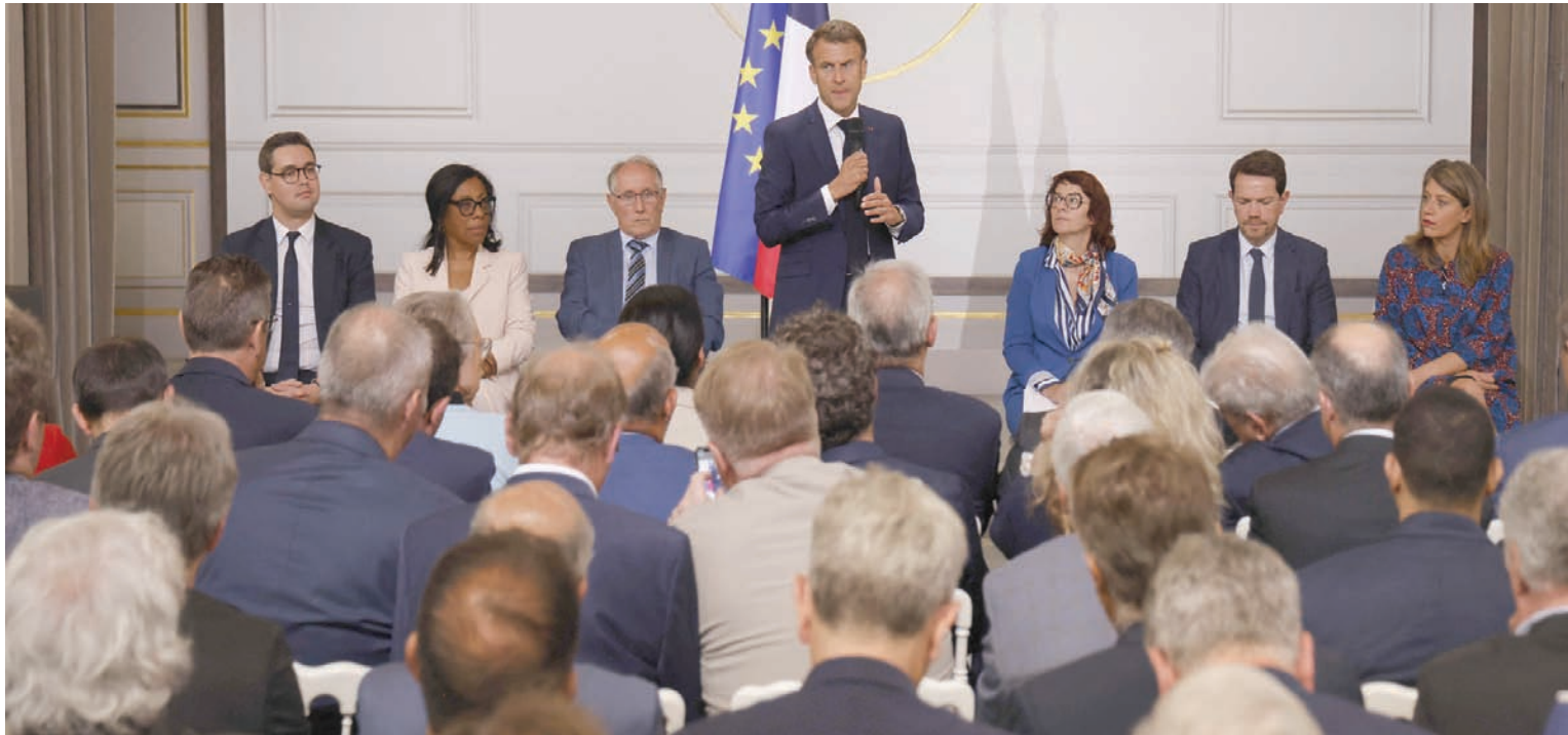
اجتمع ماكرون برؤساء البلديات بقصر «الإليزيه» في 4 يوليو (أ.ف.ب)

رئيس هيئة أرباب العمل قدرها بنحو مليار يورو، أي ما يساوي 4 أضعاف الخسائر التي مُني بها الاقتصاد الفرنسي في عام 2005، بعد 3 أسابيع من الشغب الذي بقي محصوراً في منطقة «إيل دو فرانس». أما حراك «السترات الصفراء» بين عامي 2018 و2019، فإنه شهد بالتأكيد أعمال عنف، إلا أنه لم يصل إلى الدرجة التي وصل إليها في الأيام الأخيرة، وقد نجحت وقتها المؤسسات في حماية نفسها من التخريب.