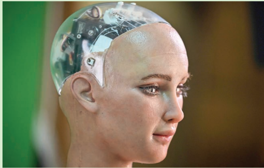
الروبوت صوفيا

وأضاف أن «الروبوتات قد تنطلق في السنوات الخمس المقبلة بنفس الطريقة التي وصل بها الذكاء الاصطناعي التوليدي وراء الروبوتات مثل ChatGPT من OpenAI هذا العام». وتستخدم HungerMap التابع لبرنامج الأمم المتحدة الإنمائي، والتي تجمع البيانات لتحديد المناطق التي تنزلق نحو الجوع. كما تعمل على تطوير شاحنات تعمل بالتحكم عن بعد لتوصيل المساعدات الطارئة في مناطق الخطر.