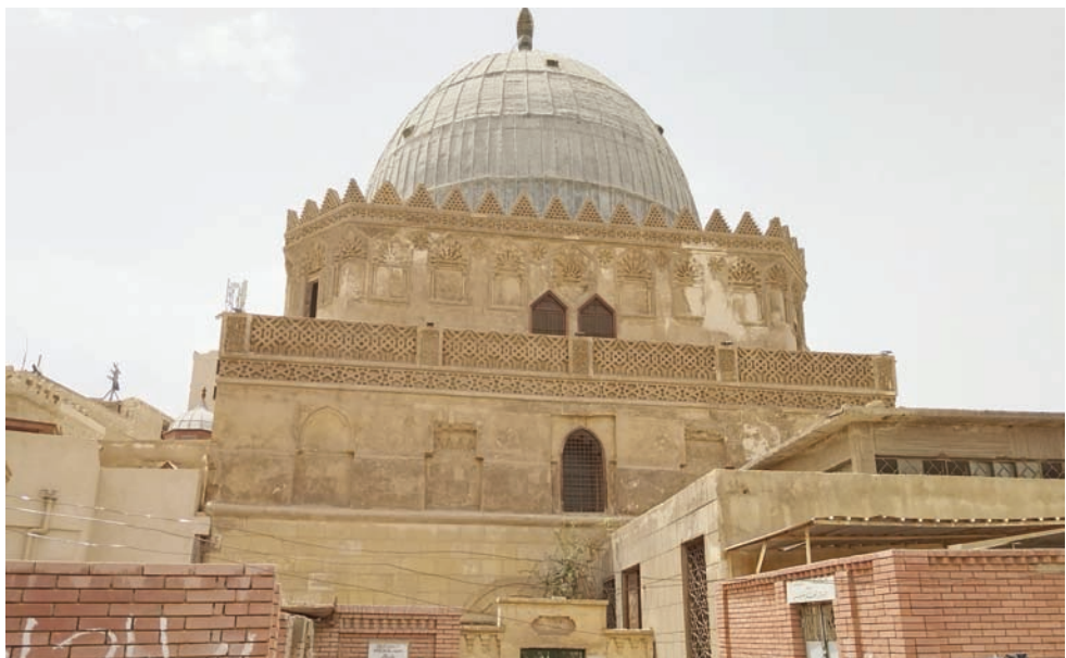
ضريح الإمام الشافعي