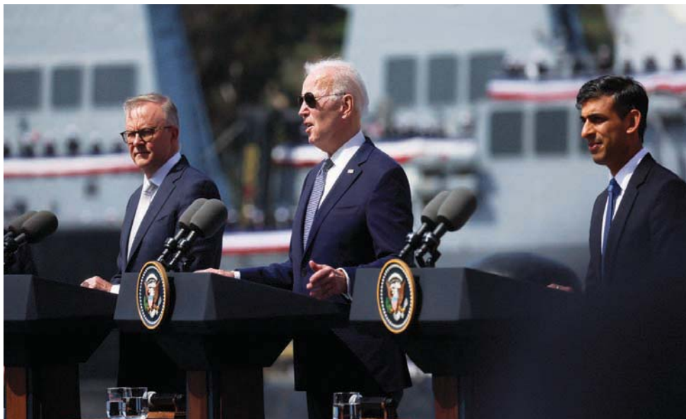
قادة «أوكوس» خلال قمة سان دييغو في مارس الماضي

والمشاركة الثلاثية، التي تُبنى على تعاونها الأمني المستمر منذ عقود، ركيزتان. دور الركيزة الأولى حول اقتناء وتطوير غواصات مسلحة تقليدياً تعمل بالطاقة النووية للبحرية الملكية الأسترالية. وتدعو الركيزة الثانية إلى تعاون واسع النطاق في القدرات المتقدمة والتكنولوجيا وتبادل المعلومات، وتضيف لورين التي يركز عملها على الابتكار الدفاعي، وتأثير التقنيات الناشئة على الأمن الدولي،