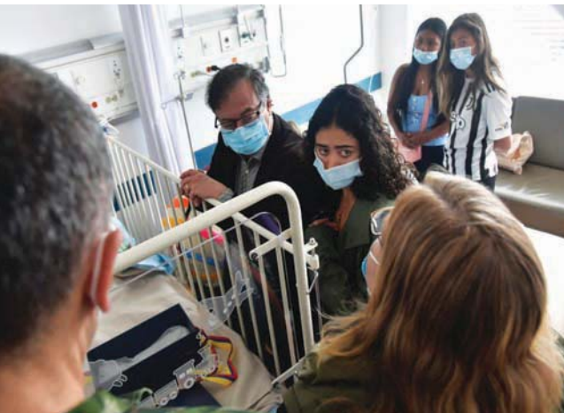
الرئيس الكولومبي غوستافو بيترو وابنته صوفيا بيترو يزوران أحد أطفال