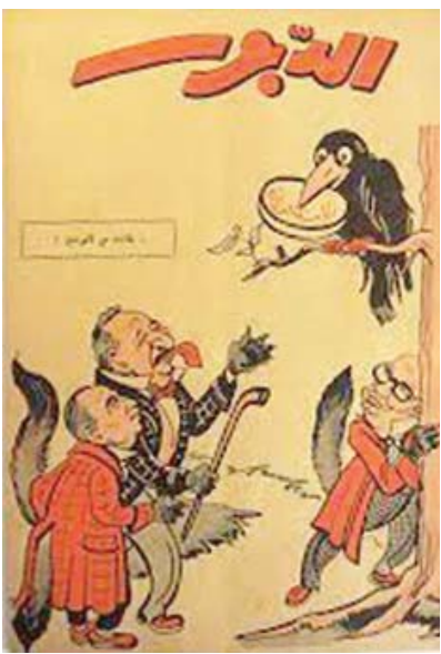
عدد من مجلة «الدبور» يعود لعام 1956 (الدبور)