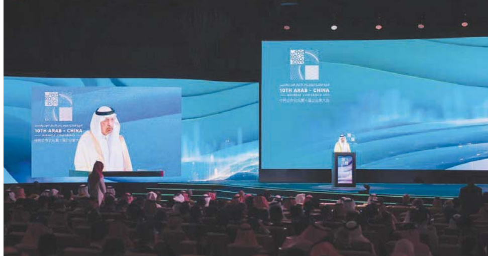
وزير الاستثمار السعودي خالد الفالح خلال كلمته أمام الحضور

وزاد الأمير فيصل بن فرحان أن الحدث يؤكد الأهمية البالغة والإمكانات الكبيرة والرؤى المشتركة