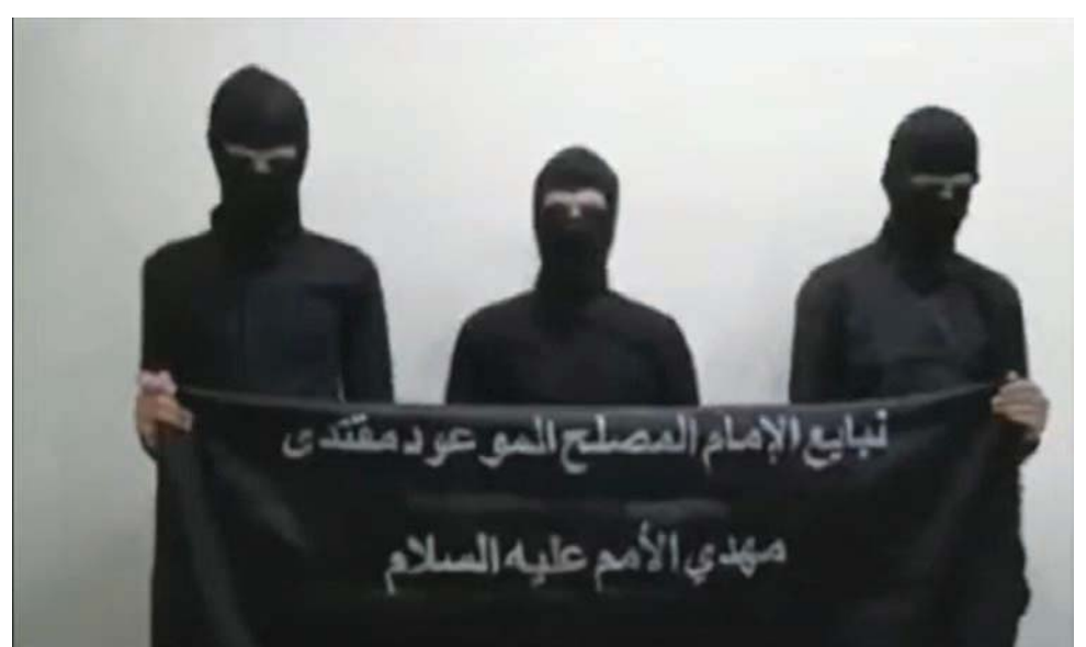
لقطة من فيديو يظهر فيه 3 ممن يسمون «أصحاب القضية»

وأردف مقتدى الصدر قائلاً: «ومن هنا أجد نفسي ملزماً بالدفاع عن هذه المرجعية المحيية، باعتباري أبناً لها ووجدياً نازراً نفسي، فهو واجب شرعي وأخلاقي وباطني، بل قلني، وأضاف: «لعل أحد أهم الأسباب لاستمرار العداء لها لأسباب سياسية قد يكون حتى من بعض من كانوا تابعين له في حياته ومرجعته (والده)، ومن بذلوا نعمة الله واستبدلوا بمرجعتهم أبخس الأثمان»، على حد تعبيره.