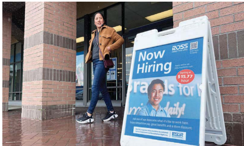
أمريكية تمشي بجانب لافتة توظيف معقّلة أمام متجر «روز دريس فور ليس» في نيوفاون، بكاليفورنيا

وبعد 10 زيادات متتالية، يريد مسؤولو المصرف المركزي الأمريكي،