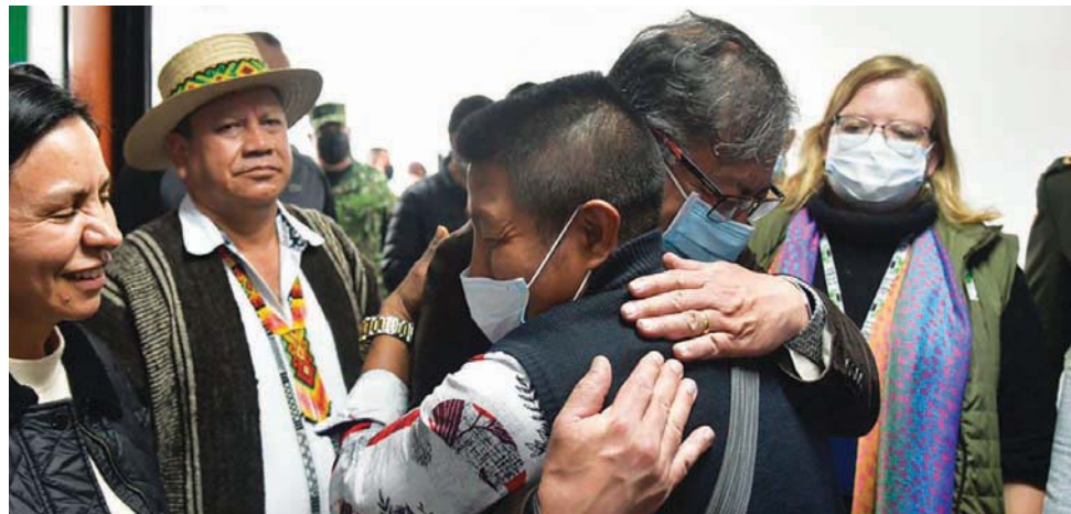
الرئيس الكولومبي غوستافو بيترو (في الخلف) يحتضن جد الأطفال الأربعة