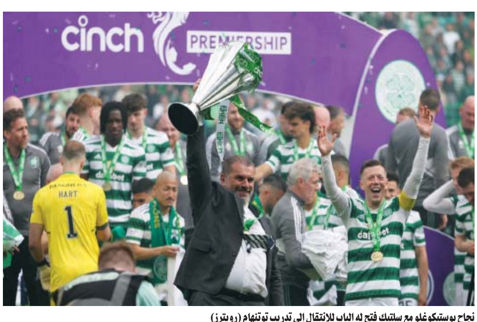
نجاح بوستيكوغلو مع ستيتك فتح له الباب للانتقال إلى تدريب توتنهام

بصراحة، هناك الكثير من العمل الذي يجب القيام به في توتنهام بغض النظر عن المدير الجديد. فمن أين يبدأ المدير الفني مع هذا الفريق؟ من الواضح أن بوستيكوغلو يفضل اللعب بطريقة 3-4-3، ولم يسبق له أن اعتمد على ثلاثة لاعبين في الخط الخلفي، لكن هذا الفريق قد تم بناؤه وفق متطلبات كوني وطريقته المفضلة 4-2-3-1. وباستثناء هاري كين، هل هناك أي لاعب آخر قد يتأثر توتنهام برحيله؟