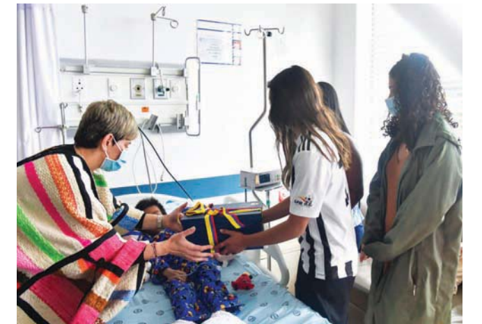
السيدة الكولومبية الأولى فيرونكا الكوسير (يسار) وصوفيا بيترو (يمين) تزوران أحد الأطفال

أسبوعين إلى 3 أسابيع. وتقول استريد كاسيريس، المدير العام للمعهد الكولومبي لرعاية الأسرة، إن الأطفال لا يتحدثون بالقدر الذي يريده المسؤولون، ولا يزالون بحاجة إلى وقت للعلاج. وتعد قصة بقاء هؤلاء الأطفال على قيد الحياة معجزة كبيرة نظراً لأن هذه الغابة هي موطن لنموور «الجاغوار» و«البوما» والشعابين والحيوانات المفترسة الأخرى، التي تهرب المخدرات وترهب السكان المحليين.