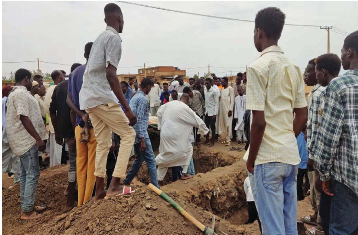
يدفنون إحدى ضحايا القصف في جنوب العاصمة