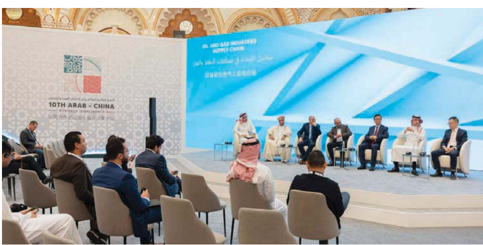
ورشات العمل التي أقيمت على هامش مؤتمر رجال الأعمال العرب والصينيين (الشرق الأوسط)

وقعت وزارة الاستثمار أيضاً اتفاقية بقيمة 266 مليون دولار مع شركة «هيبوبو» للتكنولوجيا المحدودة، مطور برمجيات الأندرويد في هونغ كونغ، لتطوير تطبيقات في مجال السياحة، وبتمويل من وزارة الاستثمار أبرمت صفقة قدرها 250 مليون دولار بين شركة «الخطوط الحديدية السعودية» (سابكو) و«سي آر آر سي» لصناعة عربات القطار المملوكة