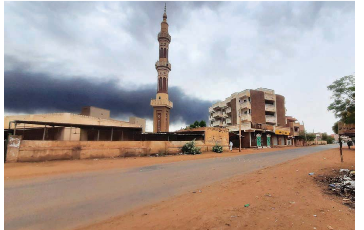
دخان الحرائق فوق الخرطوم

إلى «مغ أو الحد من أعداد المواطنين السودانيين الوافدين»، بل تأتي بعد رصد «أنشطة غير قانونية» يقوم بها أفراد على الجانب السوداني من الحدود، تشمل خصوصاً «ترويز» تأشيرات الدخول إلى مصر.