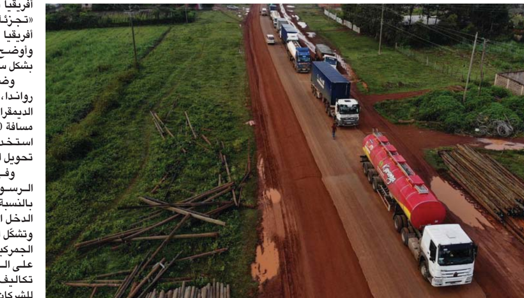
شاحنات متوقفة في طابور يبلغ طوله نحو 10 كيلومترات انتظاراً لعبور الحدود الكينية. الأوغندي

يرى هؤلاء أن التكاليف والتأخيرات تعرقل الشركات الأفريقية التي تكافح من أجل منافسة شركات منخفضة التكلفة. وفي هذا الأسبوع، قال جيريمي أوري، رئيس مصرف «إيكوبنك»، الذي ينشط في 30 بلداً، خلال مؤتمر للأعمال في أبيدجان: «لكل بلد قوانينه الخاصة، الأمر معقد جداً»، وفي عام 2019، وقّعت 54 دولة، من أصل 55 دولة عضواً في الاتحاد الأفريقي»، اتفاقية «منطقة التجارة الحرة القارية الأفريقية»، ودخلت الاتفاقية رسمياً حيز التنفيذ، في الأول من يناير (كانون الثاني) عام 2021؛ بهدف تحقيق تخفيضات بنسبة 90 في المائة في التعريفات، خلال 5 إلى 10 سنوات. ويقول «صندوق النقد