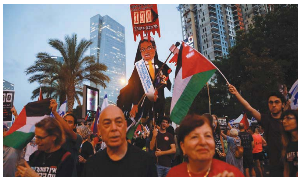
مظاهرة ضد الحكومة الائتلافية في إسرائيل وقد زُفعت فيها دمية ترمز إلى بن غفير

إلا أن مسؤولين في وزارة القضاء والمستشارة القضائية للحكومة يحتفظون على خطوة مثل هذه لتوسيع غايات «الشاباك»؛ تحسباً من المس بالديمقراطية. وحتى «الشاباك» نفسه يتحفظ على تكلفة هذه المهمة بأمر قانوني. ويقول مقيرون منه إن «الشاباك يقدم مساعدات للشرطة الآن في كل ما يتعلق بمخالفات جنائية مرتبطة بالعربي، مرتبطة بمخالفات أمنية. وعلى الرغم من ذلك، فإن الشاباك يحتفظ على إشراكه في متابعة وفك رموز جرائم جنائية في الوسط العربي بشكل روتيني. وذلك لأنه لا يريد أن يُستخدَم بوصفه قوة شرطية في الوسط العربي، وذلك تحسباً أيضاً من كشف أساليب العمل الخاصة به. وبدلاً من تجنيد الشاباك من أجل مساعدة الشرطة، ينبغي تعزيز قدراتها والقوى البرية المهنية فيها».