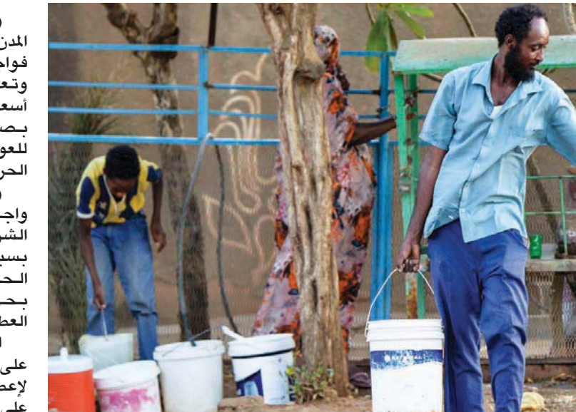
بعد توقف محطات المياه منذ بداية الحرب لا سبل إليها إلا بحملها بالأوعية إلى البيوت

ولا يعرف متى يستعيد النظام المصرفي قدرته على العمل، ولا يعرف متى تستطيع وزارة المالية تسديد الرواتب، فالحرب التي استطلت ونهب البنوك والمصارف بما فيها بعض فروع البنك المركزي، قد تعقد من مهمة الدولة في الإيفاء بالتزاماتها، حتى بعد توقف الحرب. إن توقفت.