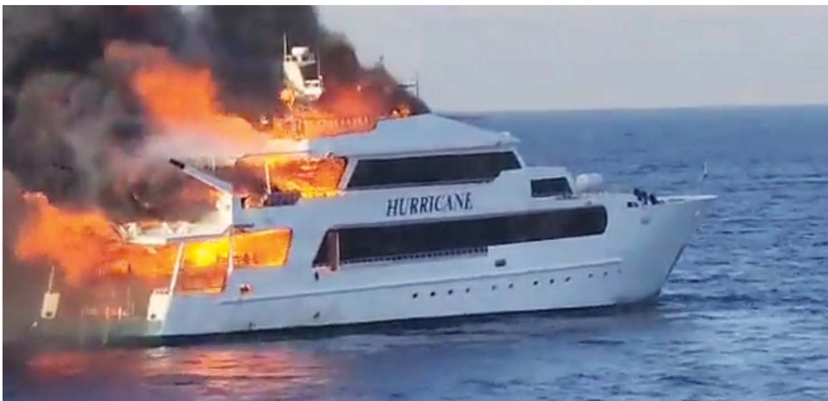
صورة من مقطع فيديو لحريق المركب السياحي بمدينة مرسى علم المصرية

ونقل البيان عن اللواء محمد بنداري، سكرتير عام محافظة البحر الأحمر، أن «الحادث جاء نتيجة نشوب حريق باللنش المسمى