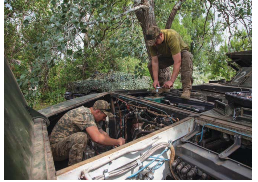
جنود أوكرانيون يصلحون عربة مشاة قتالية في منطقة دونيتسك أمس