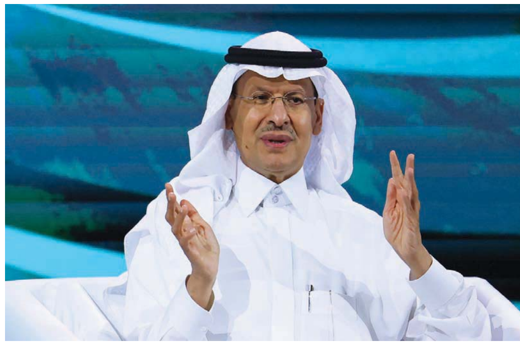
عبد العزيز بن سلمان يتحدث خلال حلقة نقاشية في مؤتمر الأعمال العربي الصيني العاشر بالرياض

وقال وزير الطاقة السعودي إن اتفاق «أوبك بلس» الجديد سيكون مجزياً لأولئك الذين يستثمرون لزيادة طاقتهم الإنتاجية. ومعرفة مستقبل أسواق النفط، وقال: «لا أمك عصا سحرية للتحبؤ بأسعار النفط»، مبيناً، في الوقت نفسه، أن أعضاء «أوبك بلس» يعملون للمحافظة على استقرار أسعار الطاقة عالمياً. وأوضح أن الموقع الجغرافي للسعودية يعزز وصولها إلى كثير من الأطراف، والمشاركة وتوسيع الاستثمارات مع جميع البلدان.