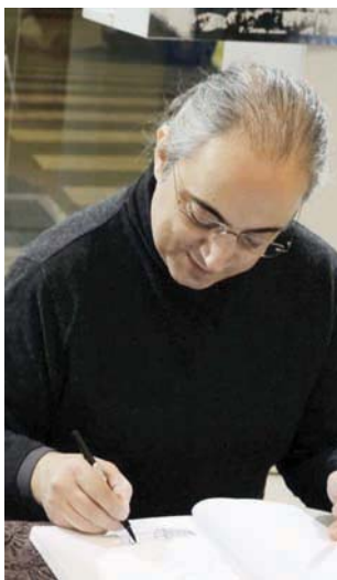
رسام الكاريكاتور أرمّان حمصي (أرمّان حمصي)