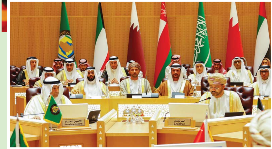
نوه المجلس بالشراكة الإيجابية والمتنامية بين مجلس التعاون والعراق (مجلس التعاون الخليجي)

التي حققها «مركز الملك سلمان للإغاثة والأعمال الإنسانية»، وبالمشاريع التنموية التي ينفذها «البرنامج السعودي لتنمية وإعمار اليمن»، وبالدعم الإنساني الذي يقدمه «مكتب تنسيق المساعدات الإغاثية والإنسانية» المقدمة من مجلس التعاون للجمهورية اليمنية، وبما تقدمه كافة دول المجلس من مساعدات إنسانية وتنموية لليمن، وأشاد المجلس الوزاري بجهود المشروع السعودي لنزع الألغام «سمام» لتطهير