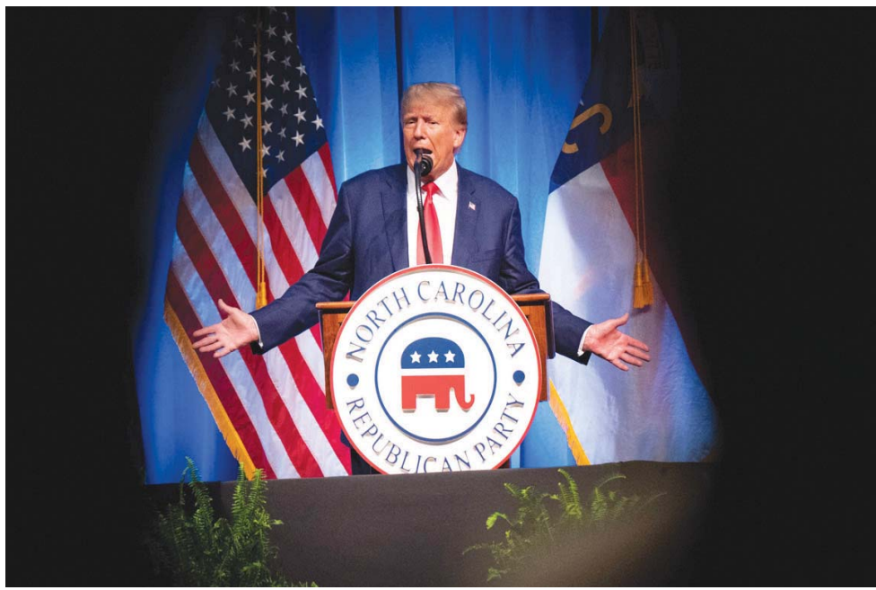
ترمب يتحدث أمام أنصاره في نورث كارولينا السبت

وهذه ثاني لائحة اتهام تطلقها الرئيس السابق خلال شهرين، بعد تلك التي أصدرها في أبريل (نيسان) قضاء ولاية نيويورك، بتهمة الاحتيال المحاسبي. وتمهد هذه الاتهامات الطريق للانتخابات رئاسية لا مثل لها، بينما تلاحق وزارة العدل المرشح الأوفر حظاً للفوز في الانتخابات التمهيدية للحزب الجمهوري. وقال ترمب في غرينيتش بورو في ولاية كارولينا الشمالية: «انتم تتعاملون مع مجانين». وأضاف: «الاتهام الذي لا أساس له ضدي» من جانب إدارة (الرئيس جو) بايدن «سيصبح من بين أفضح إساءات استخدام السلطة في تاريخ بلدنا» ونظم التجمعان قبل أيام من