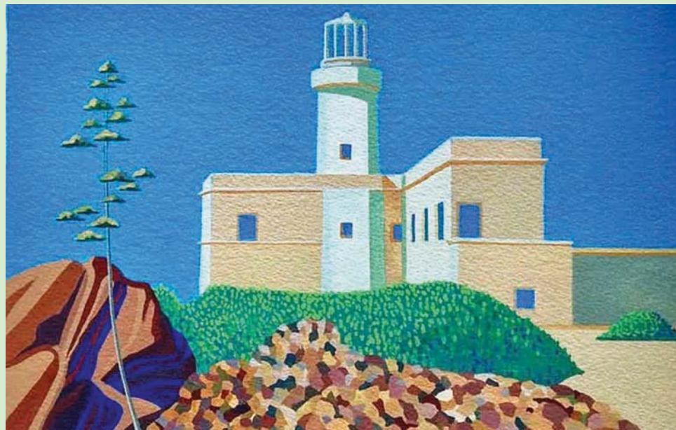
لوحة رسمها كريست فيليز للمعرض (معرض الممثلين)

مريح للأعصاب ومحفّز. لا أعرف أي نشاط آخر أستغرق فيه تماماً بهذا الشكل».