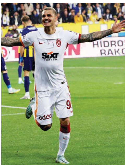
ماورو إيكاردى

من ناحية أخرى قال موقع «سبورتس سكيدا» إن نادي التعاون السعودي اتصل بمهاجم باريس سان جيرمان، الأرجنتيني ماورو إيكاردى، الذي قضى الموسم الماضي