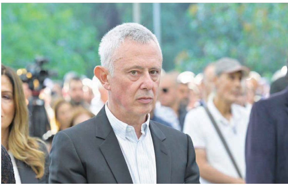
فرنجية قبل إلقاء كلمته في ذكرى مجزرة إهدن

واعتبر رئيس «تيار المردة» أن الظروف التي نمر فيها الآن تشبه