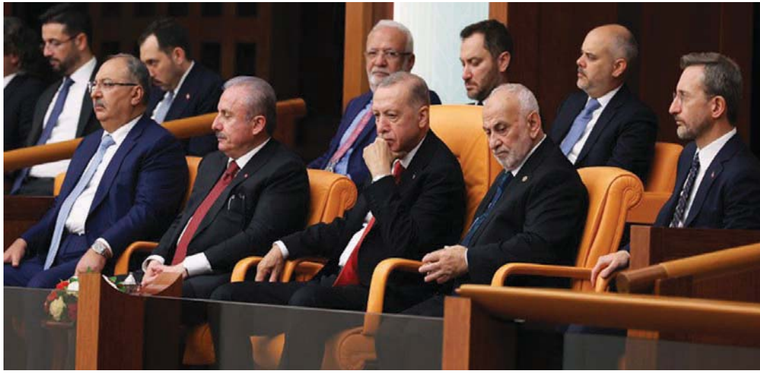
إردوغان خلال مشاركته في جلسة أداء اليمين لنواب البرلمان التركي الجديد

ويقود رئيس بلدية إسطنبول أكرم إمام أوغلو، التيار الداعي للتغيير في الحزب، وظهر ذلك في اليوم التالي مباشرة لإعلان نتائج انتخابات جولة الإعادة للانتخابات الرئاسية عندما تحدث عن ضرورة التغيير. وكرر ذلك، خلال افتتاح مركز للرياضات المائية في إسطنبول، الأحد، عندما سئل عن تعليقه على تصريحات كليتشدار أوغلو في أول مقابلة تليفزيونية منذ أيام، في أول ظهور إعلامي له بعد انتهاء الانتخابات، حيث أكد أن على رؤساء البلديات من الحزب، أن يواصلوا الخدمة في البلديات التي انتخبوا لها، وأنه لن يجري تغيير قوائم السياسة: «أنا رجل