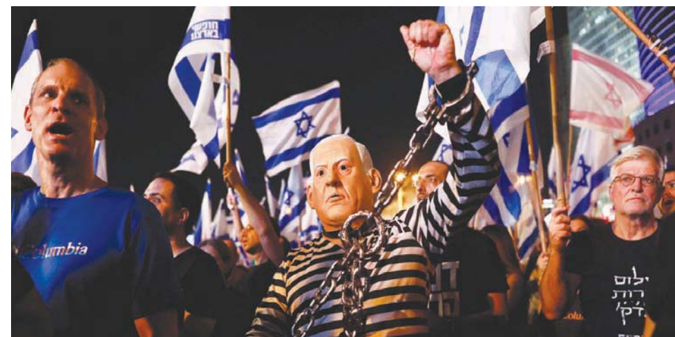
مظاهرة إسرائيلية يرئدي قناعاً يصور رئيس الوزراء بنيامين نتنياهو

بشديد اللهجة ضد «حكومة اليمين المطلق»، وانتهامها بالفشل في كل القضايا.