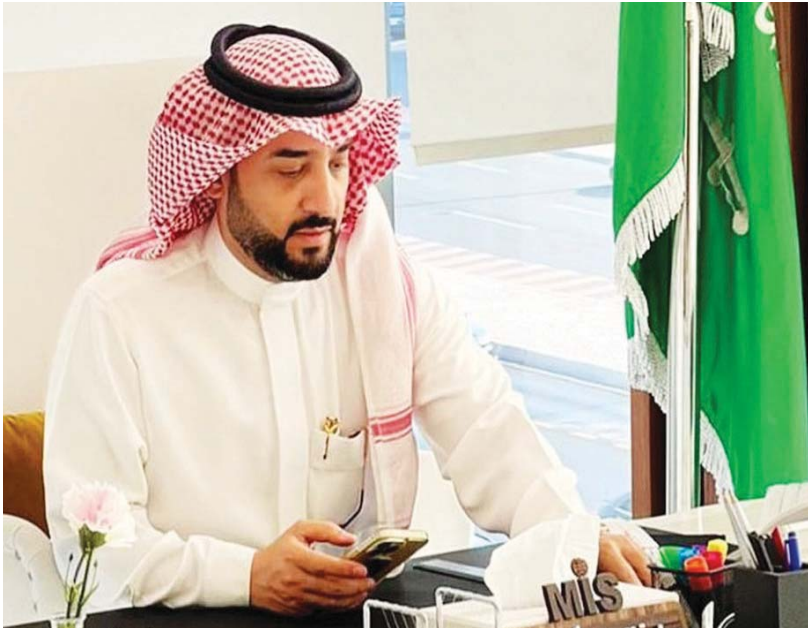
خالد العيسى (الشرق الأوسط)

وسيتّم النظر في الطعون ضد إجراءات عقد الجمعية العمومية خلال الأيام التالية، حيث ستقوم وزارة الرياضة والشباب باعتماد وكيل الوزارة لشؤون الرياضة والشباب، وباتى هذا الإعلان في إطار الالتزام بالشفافية والنزاهة في إجراءات الانتخابات لضمان مواصلة تقدم الأندية ونجاحها في مجال الرياضة.