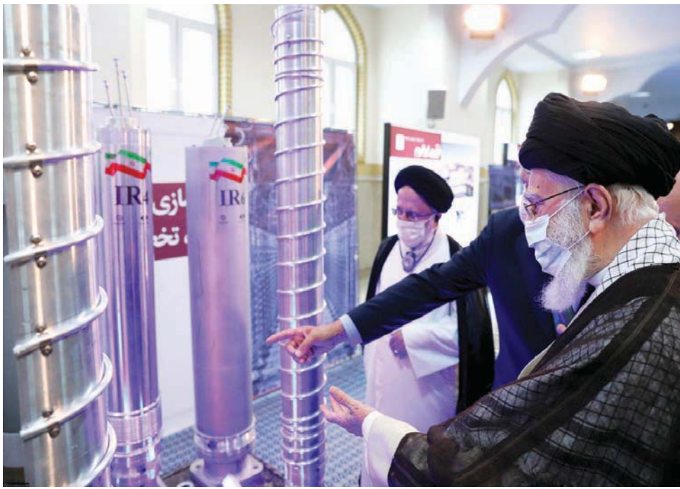
خامنئي يشير بيده إلى جهاز طرد مركزي من طراز «آر 6»، خلال معرض للصناعات النووية

وشدد خامنئي على أن الصناعة النووية تحظى بأهمية بلاده بسبب تقدم قدرات البلاد في مجالات مختلفة، وأيضاً على صعيد «الوزن السياسي العالمي والدولي للبلاد». وأضاف: «من يريد إيران قوية يجب أن يولي أهمية للصناعة النووية»، وأضاف: «الصناعة النووية من