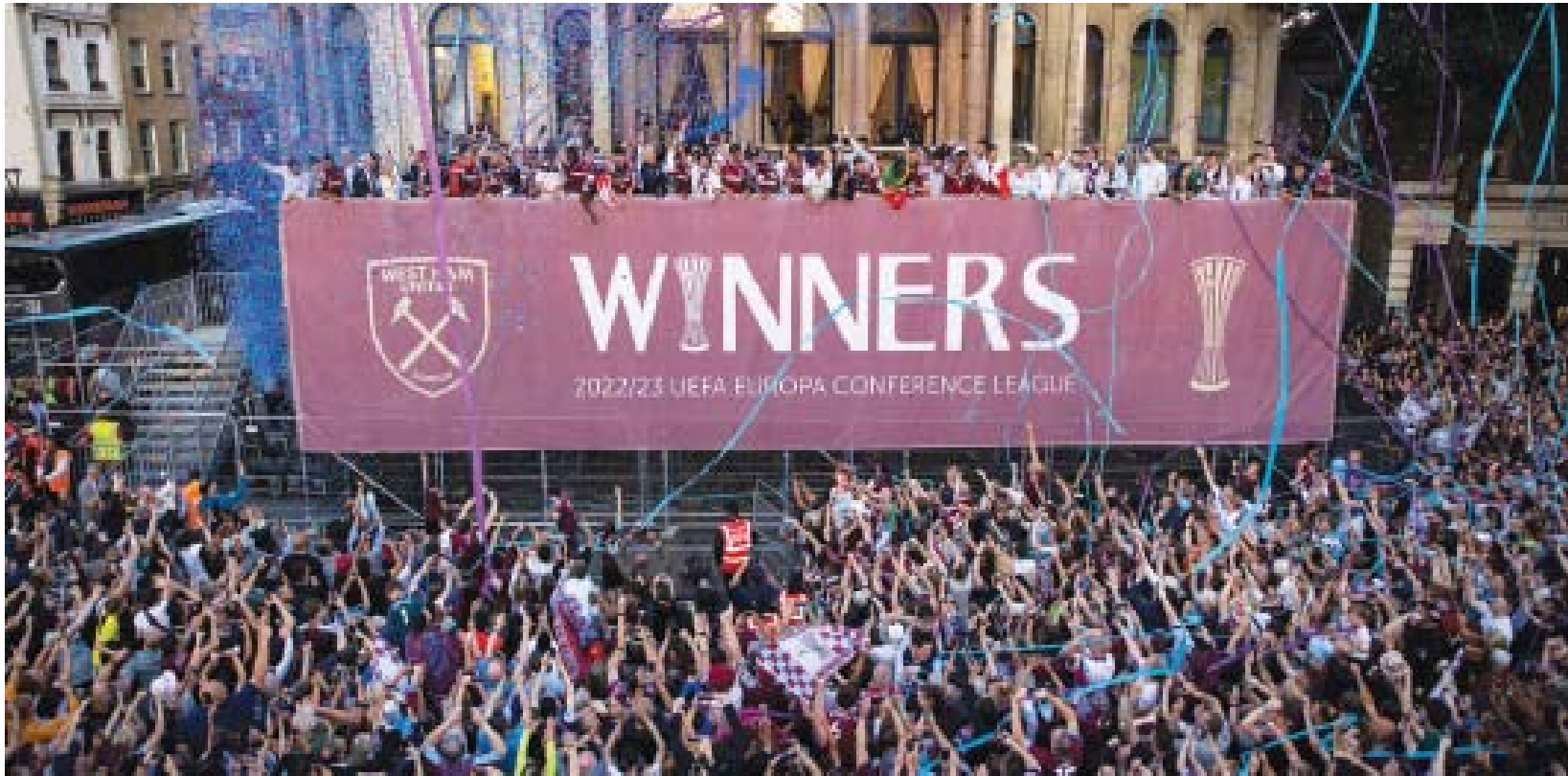
لاعبو وستهام يحتفلون وسط العاصمة لندن مع جماهيرهم بالإنجاز الأوروبي

في الدقيقة الأخيرة من الوقت الإضافي في نهائي كأس الاتحاد الإنجليزي بين وستهام وليفربول عام 2006 كانت النتيجة تشير إلى التعادل بثلاثة أهداف لكل فريق، وحصل وستهام على ركلة حرة مباشرة من الناحية اليسرى، وكانت هذه هي فرصته الأخيرة للفوز بالمباراة التي تقدم فيها مرتين قبل أن يدرك ليفربول التعادل.