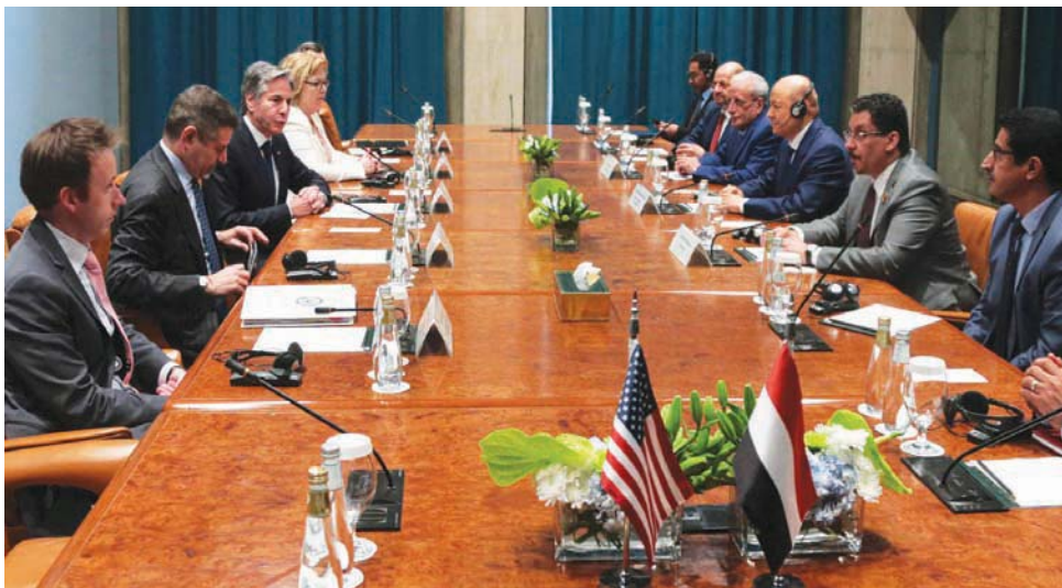
جانب من اجتماع في الرياض جمع رئيس مجلس القيادة الرئاسي اليمني مع وزير الخارجية الأميركي

وحسبما نقله الإعلام الرسمي، دعا رئيس الوزراء اليمني معين عبد الملك، المجتمع الدولي والأمم المتحدة، إلى التحرك العاجل لدعم جهود مجلس القيادة الرئاسي والحكومة وتحالف دعم الشرعية بقيادة السعودية، لردع الحرب الاقتصادية التي تشنها