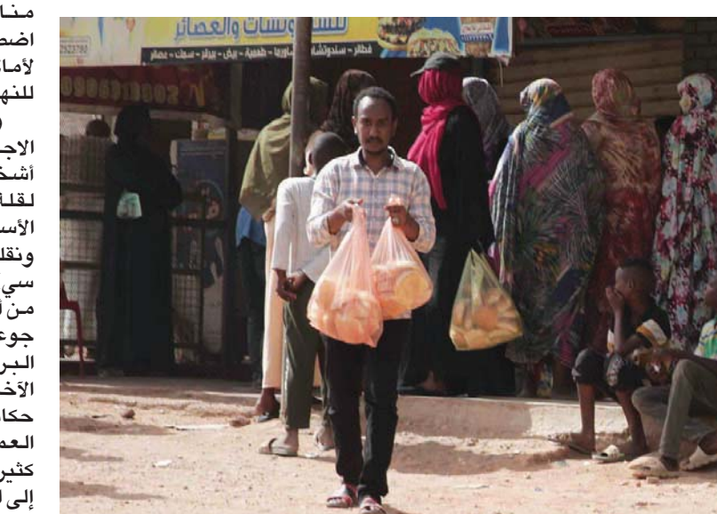
تجمع أمام أحد الأفران في الخرطوم

بعضهم محبسون في مخزن لثلاثة أيام دون أكل أو شراب».