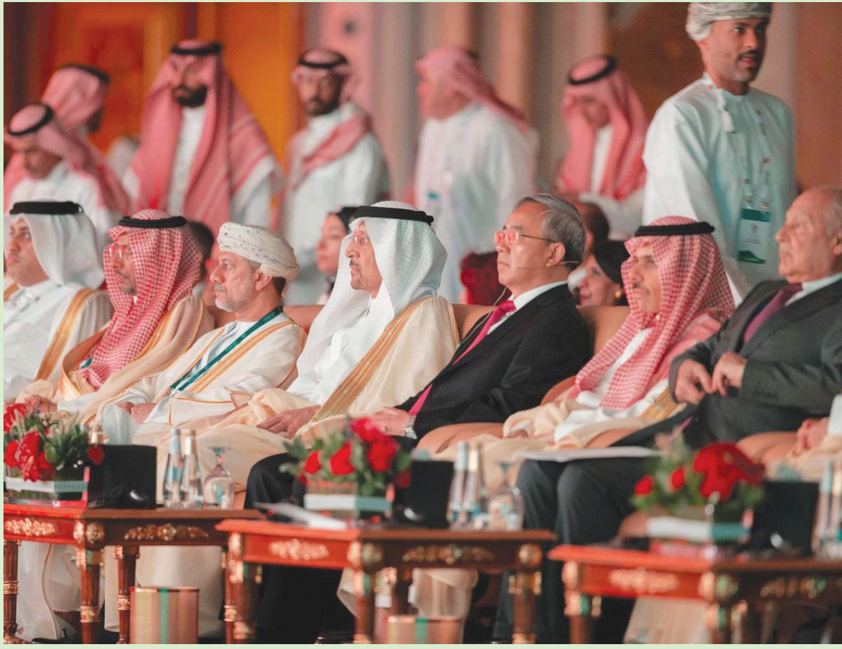
الرياض: بندر مسلم أشدّ الأمير فيصل بن فرحان بن عبد الله، وزير الخارجية السعودي، حرص الأمير محمد بن سلمان، ولي العهد السعودي، على رفع مستوى الأعمال بين الدول العربية والصين، وذلك عبر الوصول إلى مخرجات ونتائج في الدورة العاشرة من «مؤتمر رجال الأعمال العرب والصينيين» تليق بالشراكة المتقدمة في جميع المجالات الحيوية بين الطرفين. ويشّ وزير الخارجية أن المؤتمر، الذي انطلقت أعماله في الرياض أمس، يعد فرصة للعمل على تعزيز وتكريس الصداقة العربية - الصينية التاريخية، والعمل على بناء مستقبل مشترك نحو عصر جديد يعود بالخير على الشعوب، ويحافظ على السلام والتنمية في العالم». وشهد اليوم الأول توقيع اتفاقيات استثمار بقيمة تتجاوز 10 مليارات دولار، تشمل 30 صفقة في قطاعات عدة، أبرزها: التكنولوجيا، ومصادر الطاقة المتجددة، والزراعة، والعمارة، والمعادن، وسلاسل التوريد، والسياحة، والرعاية الصحية. من جهته، قال الأمير عبد العزيز بن سلمان، وزير الطاقة السعودي، إن بلاده «منفتحة، وتعمل مع جميع الدول؛ بما فيها الولايات المتحدة والصين»، وأكد في أثناء مشاركته بالمؤتمر: «لا تلتفت للانتقادات بشأن تنامي العلاقات السعودية - الصينية»، مضيفاً: «هناك دور تكاملي بين الدولتين، هناك تكامل بين (مبادرة الحزام والطريق) و(رؤية 2030)، هناك انسجام وتكامل بينهما». (تفاصيل ص 14)