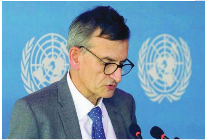
المبعوث الأممي للسودان فولكر بيرتس

شخصاً «غير مرغوب فيه» «بتنافي» ومبادئ الأمم المتحدة» ولا يمكن تطبيقه»، لافتاً إلى أن صفة الألماني فولكر بيرتس «لم تتبدل».