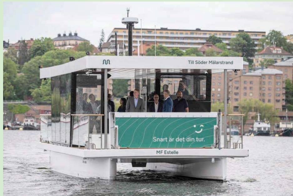
القارب «إم إف إستيبل» في أول رحلة له في العاصمة السويدية