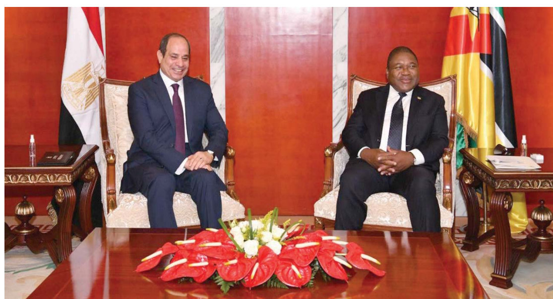
الرئيس المصري خلال لقائه الرئيس الموزمبيقي أمس في ماپوتو

وأكد الرئيس المصري وجود أفاق «واسعة» لتطوير مستوى التعاون الاقتصادي بين مصر وموزمبيق، مشيراً إلى أن هذا الصدد إلى «أهمية العمل على الارتقاء بمعدلات التبادل التجاري بين البلدين لتتسق مع مستوى العلاقات الثنائية المتميزة، فضلاً عن الحرص المتبادل على تعزيز وجود الشركات المصرية العاملة