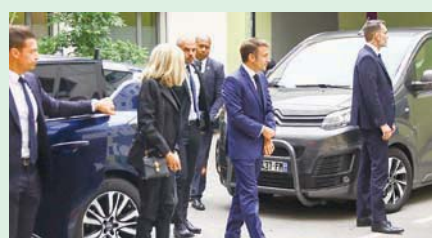
ماكرون يزور الأطفال ضحايا هجوم السكين في المستشفى 7