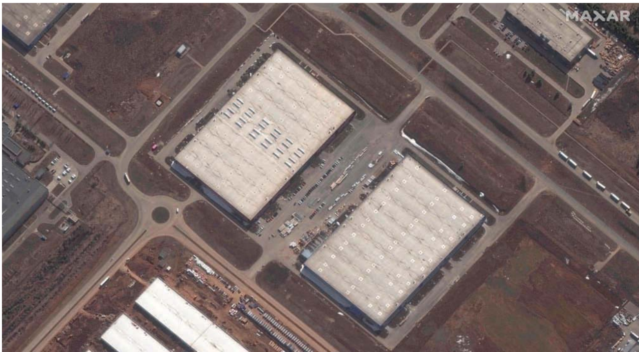
صورة التقطتها الأقمار الاصطناعية للموقع الذي جرى اختياره لبناء مصنع الميسرات

وشدد غونتهامر على أن رفع العقوبات عن إيران من شأنه أن يؤجج نشاطاتها الخبيثة على مستوى العالم.