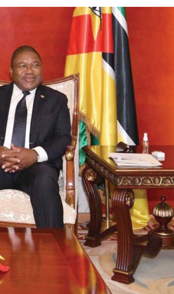
الرئيس المصري خلال لقائه الرئيس الموزمبيقي أمس في ماپوتو

ورحب الرئيس الموزمبيقي بـ«الزيارة التاريخية للسيسي»، معرباً عن اعتزازه ببلاده البالغ بها، كونهما أول زيارة على الإطلاق لرئيس مصري إلى ماپوتو، وثمن نيوسي جولة السيسي الأفريقية، «كونها تعكس اهتمام مصر العميق بالقارة»، وفقاً للمتحدث