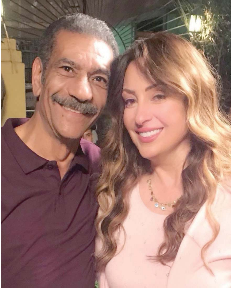
مع سيدرجي في مسلسل «أبو العروسة»

لله، مستورة، أمي كانت تحتاج إلى نفقات لعلاجها، وبعد وفاتها لم يعد يفرق معي شيء، واعتبر العمل رزقاً من الله سيأتي حتماً في وقته، لكنني أواجه مشكلة في أعمال صورتها منذ عشر سنوات ولم اتقاض أجرها حتى الآن، فقد صورت مسلسل (الإمام الخزالي)، لقطاع الإنتاج بالتلفزيون، وكان ياما (أصوات القاهرة) عام 2012، وتحدثت لمسؤولين بالتلفزيون، وكتبت شكواي عديدة، لكن لم يتحقق شيء، والغريب أن جميع زملائي تقاضوا أجورهم منذ فترة».