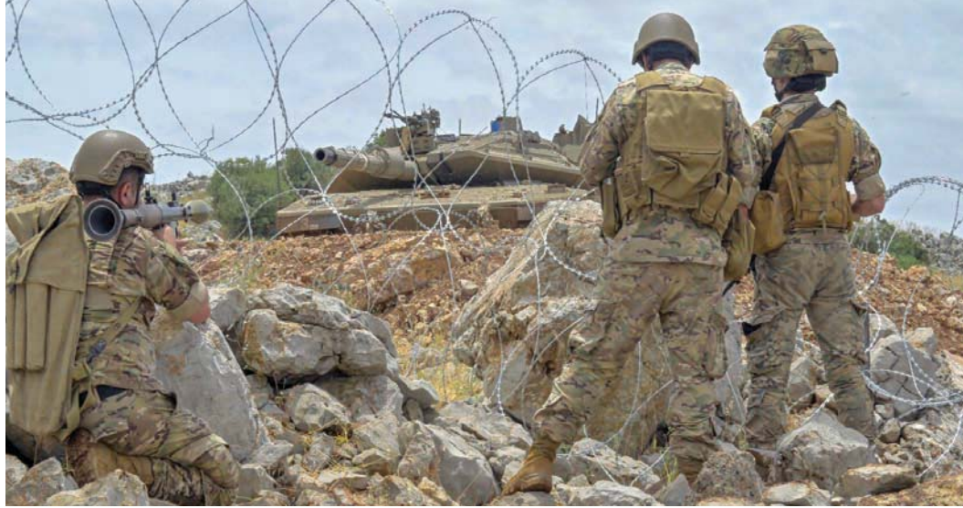
جندي لبناني يوجه سلاحه نحو دبابة إسرائيلية توجه أيضاً مدفعها باتجاهه

زفت فيها الإعلام اللبنانية. وقالت مصادر ميدانية إن أهالي المنطقة «أزالوا أسلاكاً شائكة وضعتها إسرائيلي»، في حين «رُبت القوات الإسرائيلية بالبقاء قنابل مسيلة للدموع؛ في محاولة لتفريق المحتشد». وأفادت وسائل إعلام محلية بإصابة مواطن لبناني بالقنابل المسيلة للدموع، كما أصيبت سيارة مدنية بقنبلة دخانية. وعلى السفور، انتشرت القوات الإسرائيلية في المنطقة المقابلة بشكل كبير، واستقدمت البات عسكرية، في حين استقدم الجيش اللبناني وقوات «يونيفيل» تعزيزات إلى المنطقة. ونشر الجيش اللبناني صوراً تُظهر اتخاذ عناصره وضعية قتالية وراء السياج الشائك، وبدأ الجيش على مسافة «صفر»، مقابل القوات الإسرائيلية التي انتشرت إلى جانب السياج، وعلى التلال المواجهة لتفطع التماس.