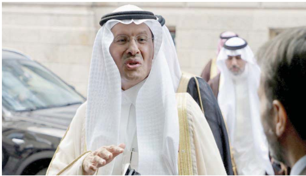
وزير الطاقة السعودي الأمير عبد العزيز بن سلمان لدى وصوله لمقر اجتماع «أوبك» في فيينا يوم الأحد الماضي

وقال بارفيت إن انخفاض الأسعار يخبئ حقيقة أن سوق النفط لم يتغير كثيراً عن العام الماضي، ولا تزال تشهد شحاً، مع طاقة إنتاج فائضة محدودة للتعامل مع زيادة الطلب في المستقبل. وأردف قائلاً إن انتعاش النشاط الاقتصادي بالصين، ومعه زيادة الطلب، يمكن أن يغير المعنويات في السوق بسرعة.