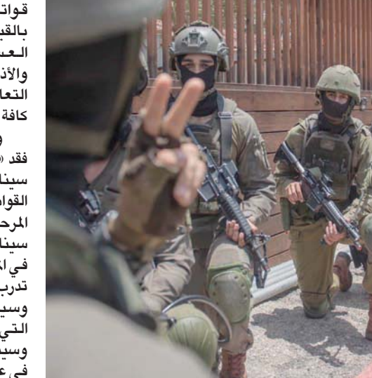
مجموعة من جنود الجيش الإسرائيلي خلال مشاركتهم أمس في تدريبات «القبضة الساحقة»

قواته النظامية والاحتياطية، بدءاً بالقيادة العامة، وانتهاء بالوحدات العسكرية، من جميع القيادات، والأذرع والهياكل. وحاكى المتمرين التعامل مع التحديات على الجبهات كافة بشكل متزامن. وحسب المناطق بلسان الجيش، فقد «تم في إطار التمرين التدريب على سيناريوهات الدفاع من خلال كثير من القوات على امتداد الجبهة اللبنانية في المرحلة الأولى، ثم انطلقت الفرقة إلى سيناريوهات الهجوم الواسع النطاق في المرحلة الثانية. وتزامناً مع ذلك، تدريب سلاح الجو على بدء قتال شرس، وسيناريوهات الدفاع الجوي المركبة التي تشمل آلاف المقاتلين الاعتراض، وسيناريوهات شن غارات استراتيجيّة في عمق أراضي العدو، على الساحة الشمالية بأكملها، وتحقيق التفوق الجوي في المنطقة، وشن غارات كثيفة وفتاكة على آلاف الأهداف النوعية، باستخدام مئات الطائرات من المنظومات كافة». وخلال الأسبوع الثاني، أجرى تمرين على قتال تخوضه أذرع متعددة