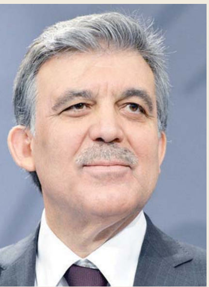
عبد الله غل

شغل عبد الله غل منصب وزير الخارجية، في 14 مارس 2003، بعدما استقال من منصب رئيس الوزراء لإفساح المجال أمام رجب طيب إردوغان لترؤس الحكومة، في أعقاب إسقاط الحظر الدستوري عنه. وظل غل في هذا المنصب حتى 28 أغسطس (آب) 2007 حين غادره ليصبح رئيساً للجمهورية.