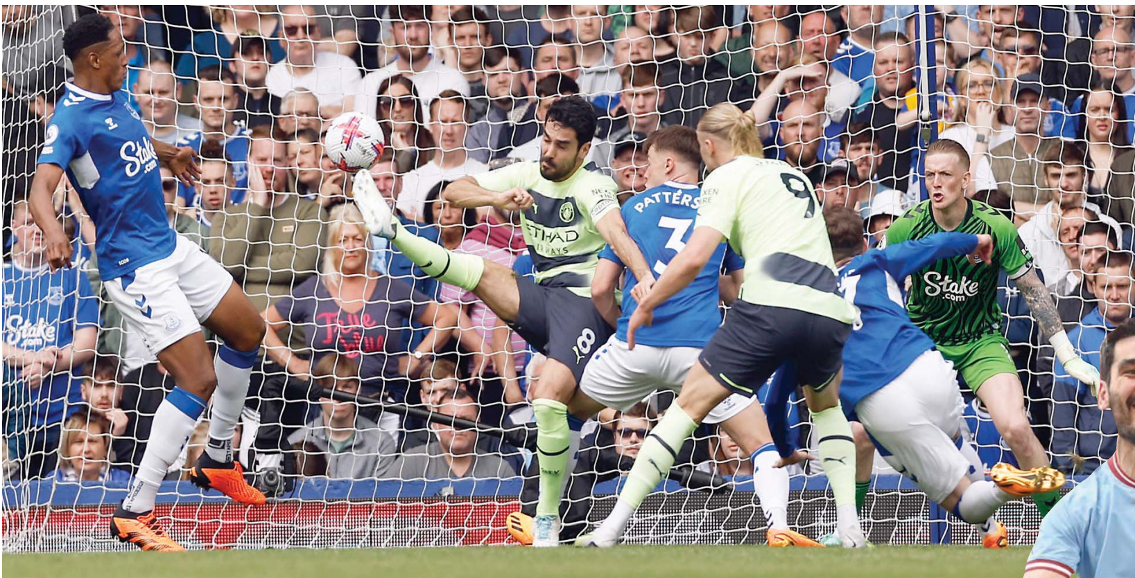
الأهداف التي أحرزها غوندوغان هذا الموسم حسمت الكثير من المواجهات المهمة

لقد كان غوارديولا يشعر دائماً بقدره غوندوغان على إحراز هذه النوعية من الأهداف، لذلك منحه حرية التقدم إلى الأمام قبل 3 مواسم، ومنذ ذلك الحين سجل لاعب خط الوسط الألماني 38 هدفاً، كان أحدها حاسماً في الفوز بلقب الدوري الإنجليزي الممتاز في موسم 2021-2022، وهو الهدف الحاسم في مرمرى استون فيلا. ومع ذلك، لا تزال الشكوك تحوم حول مستقبل غوندوغان مع مانشستر سيتي. لقد أعلن كل طرف من الطرفين رغبته بتحديد التعاقد، لكن لم يتم التوقيع على عقد جديد حتى الآن. وتعاقد غوندوغان وغوارديولا فور نهاية المباراة النهائية لكأس الاتحاد الإنجليزي على «ملعب ويمبلي»، في مشهد يعكس قوة العلاقة بين الرجلين. من المؤكد أن خسارة لاعب بهذه القدرات والإمكانات وهذه الشخصية الرائعة ستكون بمثابة ضربة قوية لمانشستر سيتي، على الرغم من أن الفريق قادر على التكيف مع رحيل أي لاعب حتى ولو كان أساسياً، كما رأينا من قبل.