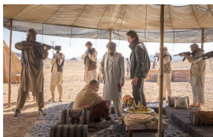
توفر الهيئة حوافر مميزة لشركات الإنتاج ودعمًا لوجستيًا متكاملًا (فيلم العلاء)

أما على الصعيد اللوجستي، فاكتت جونز أن لديهم فريقاً من الخبراء على الأرض، ويمكن التواصل معهم في أي وقت لدعم عمليات الإنتاج. ويقدم الفريق المساعدة عبر اكتشاف الأخطاء وإصلاحها، بدءاً من مرحلة إعداد العمل إلى تسليمه، وأيضاً المساعدة في الحصول على الخصم النقدي، والمهمات الإدارية الأخرى مثل لوائح الإنتاج، والتخليص الجمركي، وطلبات التأشيرات، وتصاريح التصوير، إلى المساعدة في اختيار المواقع وتوظيف المواهب.