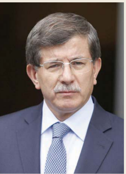
أحمد داود أوغلو