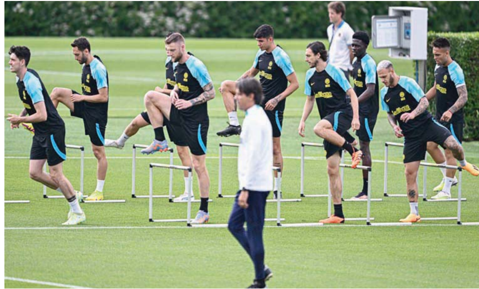
إنتر ميلان يستعد لحصد لقب غائب منذ سنوات