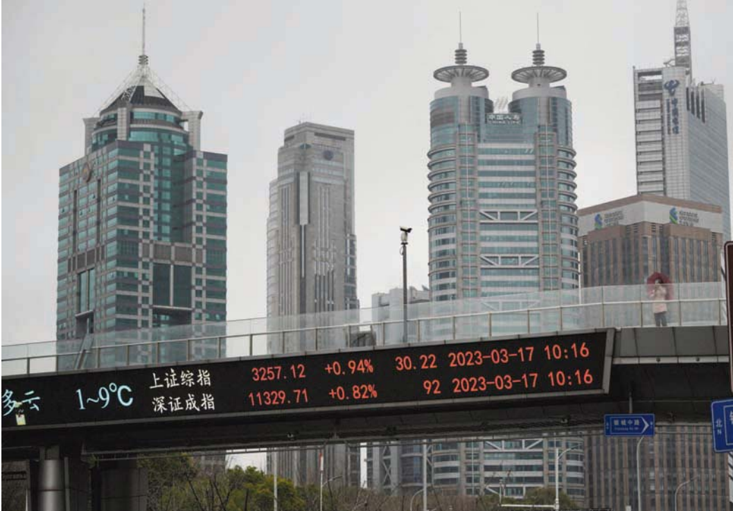
شاشة ضخمة على أحد الجسور في مدينة شنغهاي الصينية تعرض حركة الأسهم على مؤشرى شنغهاي وشينزين

أظهر تقرير صادر عن مجموعة «بنك أوف أميركا» المصرفية الأميركية تراجع حالة الحماس لأسهم شركات التكنولوجيا التي فجرتها فورة الذكاء الاصطناعي، حيث سجلت أسهم شركات التكنولوجيا خلال الأسبوع الماضي أول انسحاب للاستثمارات منذ نحو 8 أسابيع. ونقلت وكالة «بلومبرغ» للأنباء عن تقرير البنك القول إن حجم الأموال التي خرجت من أسهم التكنولوجيا خلال الأسبوع الماضي بلغ 1.2 مليار دولار، بحسب بيانات شركة «إي بي إف آر غلوبال» للبيانات المالية. وقال محللو «بنك أوف أميركا» بقيادة ميشيل هارنت، في تقرير نشر مساء الخميس، إن البنوك المركزية ستعاود زيادة أسعار الفائدة، مشيرين إلى قرارى زيادة أسعار الفائدة المفاجئين في كل من كندا وأستراليا خلال اليومين الماضيين. كما استبعد المحللون توقف مجلس الاحتياطي الفيدرالي (البنك المركزي الأميركي) عن زيادة أسعار الفائدة في ظل استمرار معدل البطالة المنخفض ومعدل التضخم المرتفع.