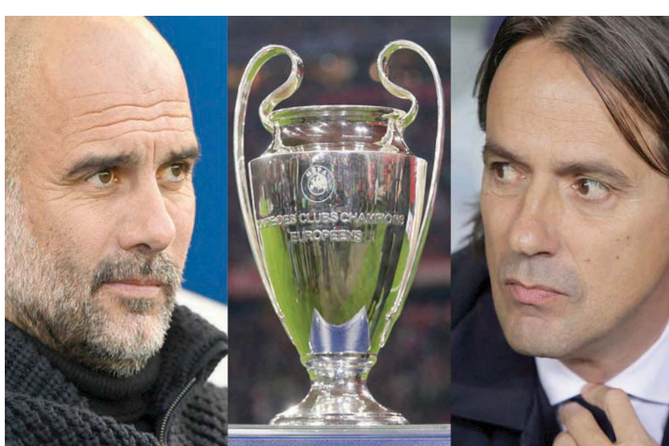
إنزاعي وغوارديولا والكاس... من ستبتمس له إسطنبول؟

في المقابل، يعرف إنتر ماذا ينتظره، خصوصاً مهاجمه البوسني إدين دزيكو (37 عاماً) الذي حمل الوان سيتي بين 2011 و2016. سجّل 14 هدفاً هذا الموسم وكان معاوناً هجومياً ناجحاً للنجم الأرجنتيني لوتارو مارتينيز.