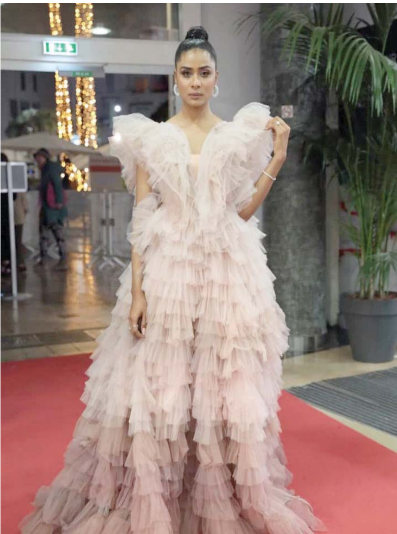
الفنانة السودانية إيمان يوسف (الممثلة)