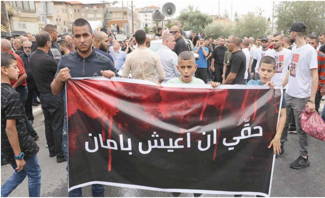
متظاهرون ضد عمليات القتل في المجتمع العربي خلال مسيرة ببلدة يافة الناصرة الجمعة

لفهم ما جرى في بلدة يافة الناصرة، التي قتل فيها 5 أشخاص بعميلة واحدة للإجماع المنظم، نجب مراجعة نص هذه المحاكمة: «لن نقلك أنت بل سنحرق قلبك. سنقتل أحسن شخص في عائلتك»، وأغلقت سماعة الهاتف.