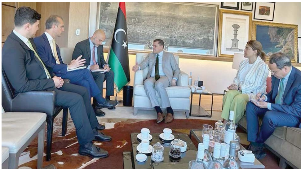
الديببة مستقبلاً سفير إيطاليا الجديد لدى ليبيا جانلوكا البيري بني بمقر إقامته في روما

وكانت بعثة الأمم المتحدة في ليبيا قد دعت الأطراف الفاعلة في البلاد إلى التوافق، والإنخراط في مساعي معالجة القضايا العالقة، «وخلق بيئة أوفر أمناً، وأكثر ملاءمة لإجراء الانتخابات خلال العام الحالي، أما فرنسا فتحاول في المقابل مضاعفة دورها الدبلوماسي في ليبيا، عبر جولات يجريها مبعوثها الخاص، وسفيرها إلى ليبيا، بول سولير، ومصطفى مبراج، حيث أجريا لقاء مع طرابلس مع المبعوث الأممي،