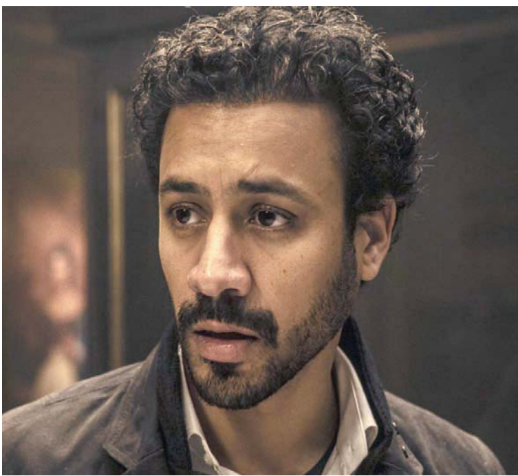
الفنان أحمد داود في لقطة من فيلم «يوم 13»

وتصنع حالة خاصة بها توافق واتساق مع المشاهد، وفيلم (يوم 13) من هذه النوعية من الأعمال المتعة للممثل، والمحبة للجمهور، لذلك شعوري بالتفاؤل تجاه تصدوره وإعجاب الناس به لم يخب».