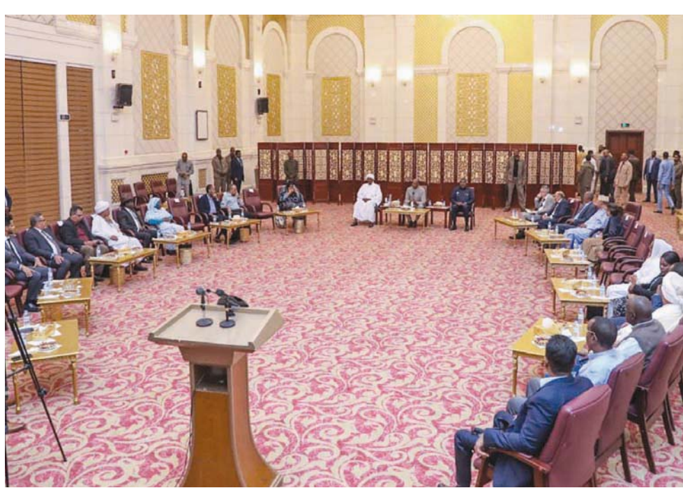
اجتماع سابق للأطراف الموقعة على الاتفاق الإطاري برئاسة الفريق البرهان