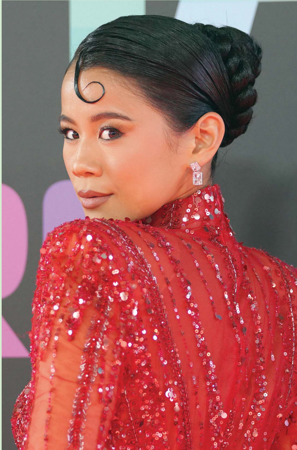
الممثلة الأمريكية لي لويس حضرت العرض الأول لفيلم «Elemental» في لوس أنجلوس بولاية كاليفورنيا

اشتكت زوجة خليجية من حب زوجها الشديد لها، ورفعت دعوى (خلع) بعد مرور سنة واحدة فقط على الزواج، بدعوى أن (حبه خنقها) كما قالت، فيما دافع الزوج عن نفسه متسائلاً بتعجب عما إذا كان حبه لزوجته يعتبر جريمة؛ وأوضحت المرأة في دعواها أمام المحكمة أنها بعد مرور سنة على زواجها، تشعر بانها تختنق من حب زوجها الشديد لها، فهو يلبي كل طلباتها من تنظيف المنزل، وتحضير الطعام، ولم يقش عليها يوماً، واضطر زوجها (الخنقة) أن يطلقها، وبعد ذلك (اجهش بالكاء) - هيا بالله عليكم ماذا تقولون عنه؟