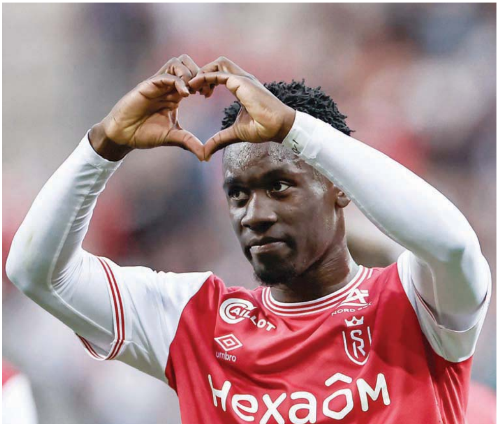
فولارين بالوغون فضل المنتخب الأمريكي على الإنجليزي

محاظاً طوال الوقت بالمشجعين الأمريكيين، وقال في وقت لاحق إنه كان مغموراً بـ«الحب» الذي يشعر به من الجمهور الأمريكي. من المؤكد أنه من الرائع أن تشعر بانك شخص مرغوب جداً. وفي الوقت نفسه، قال المدير الفني للمنتخب الإنجليزي، غاريت ساوتغيت، لوسائل الإعلام: «لا يمكننا أن نستدعي لاعباً للانضمام إلى المنتخب الإنجليزي