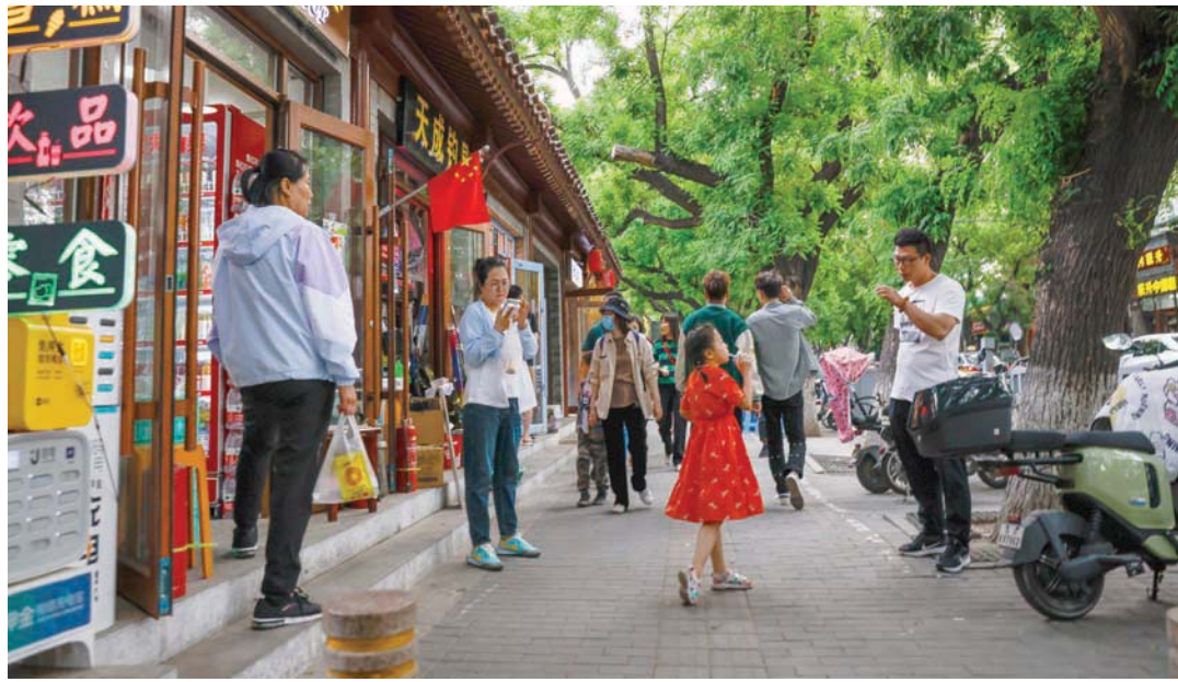
منطقة تجع بالمعاجر في بكين

وأظهرت بيانات رسمية، نُشرت يوم الثلاثاء الماضي، أن الحكومة السويسرية سيكون لها الحق في مطالبة بنك «يو. بي. إس» غروب بتعديل خطته لإدارة الأصول التي تغطيها ضمانات القروض، التي قدمتها الحكومة للبنك بقيمة 9 مليارات فرنك سويسري، عقب استكمال الاستحواذ على مُنافسه المتعثر «كريدي سويس غروب».