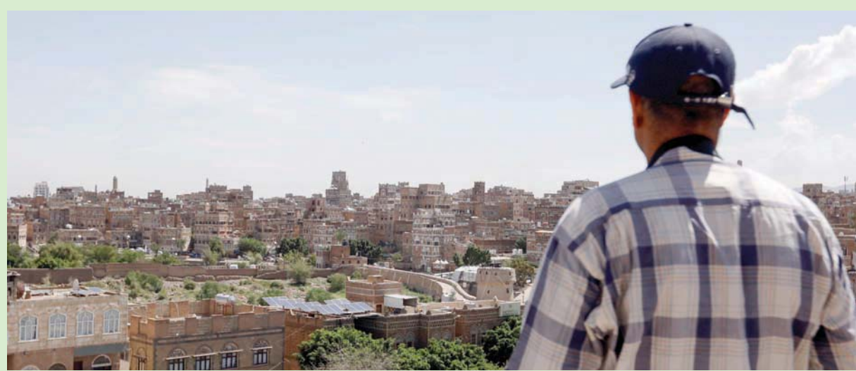
يمني يتأمل المدينة القديمة في صنعاء المسجلة ضمن التراث العالمي باليونيسكو

محذراً من أن «العواقب تُبرهن المخاوف من استمرار الصراع والدخول في حرب استنزاف طويلة المدى تُدخّل اليمن في مرحلة صعبة، ويتحول اليمن إلى أزمة منسبة بيساط الحوثيين سيطرتهم على الشمال، مع الخوف من أن تفقد الحكومة الشرعية سيطرتها على عدن وباقي المحافظات خصوصاً مع تردي الخدمات».