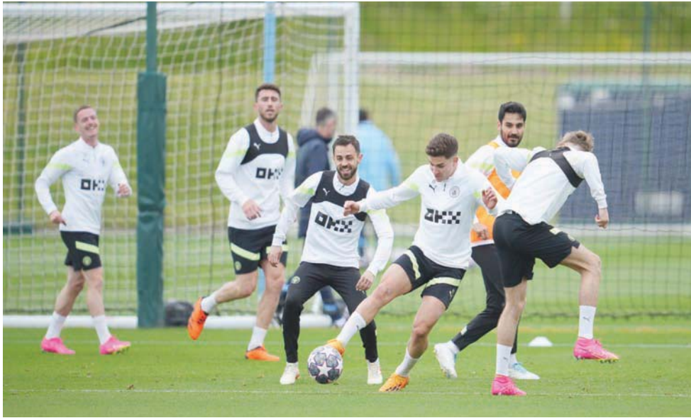
مانشستر سيتي على بعد خطوة واحدة من تحقيق إنجاز تاريخي