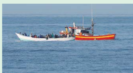
وأخيراً... اتفاق أوروبي حول ميثاق الهجرة 10