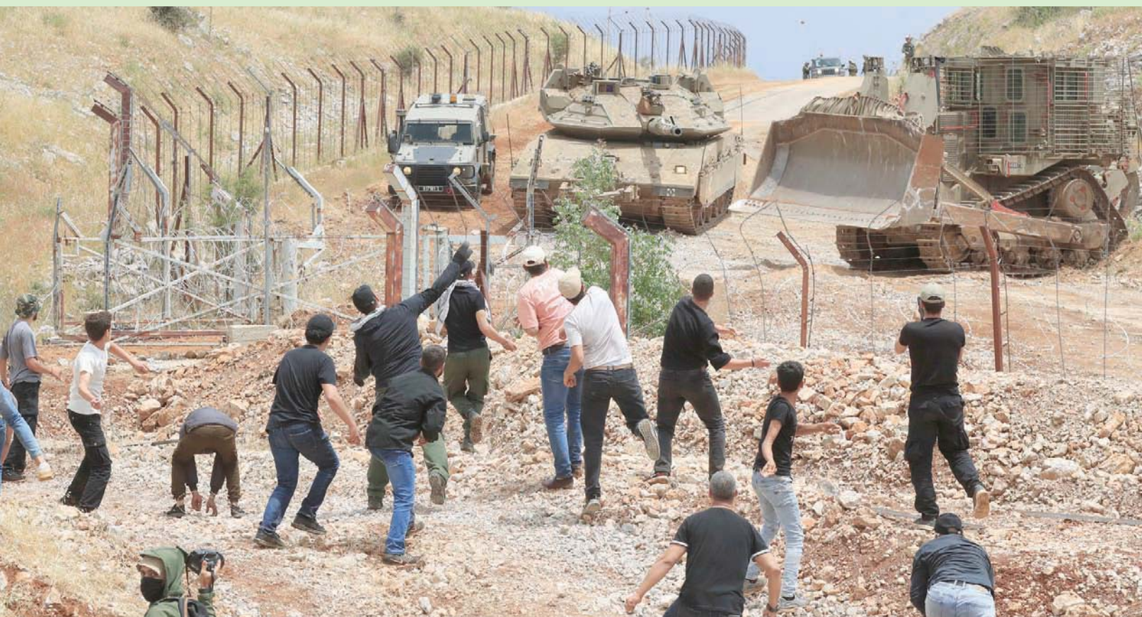
مواطنون يرمون الحجارة على قوة إسرائيلية عند أطراف بلدة كفر شوبا في جنوب لبنان أمس