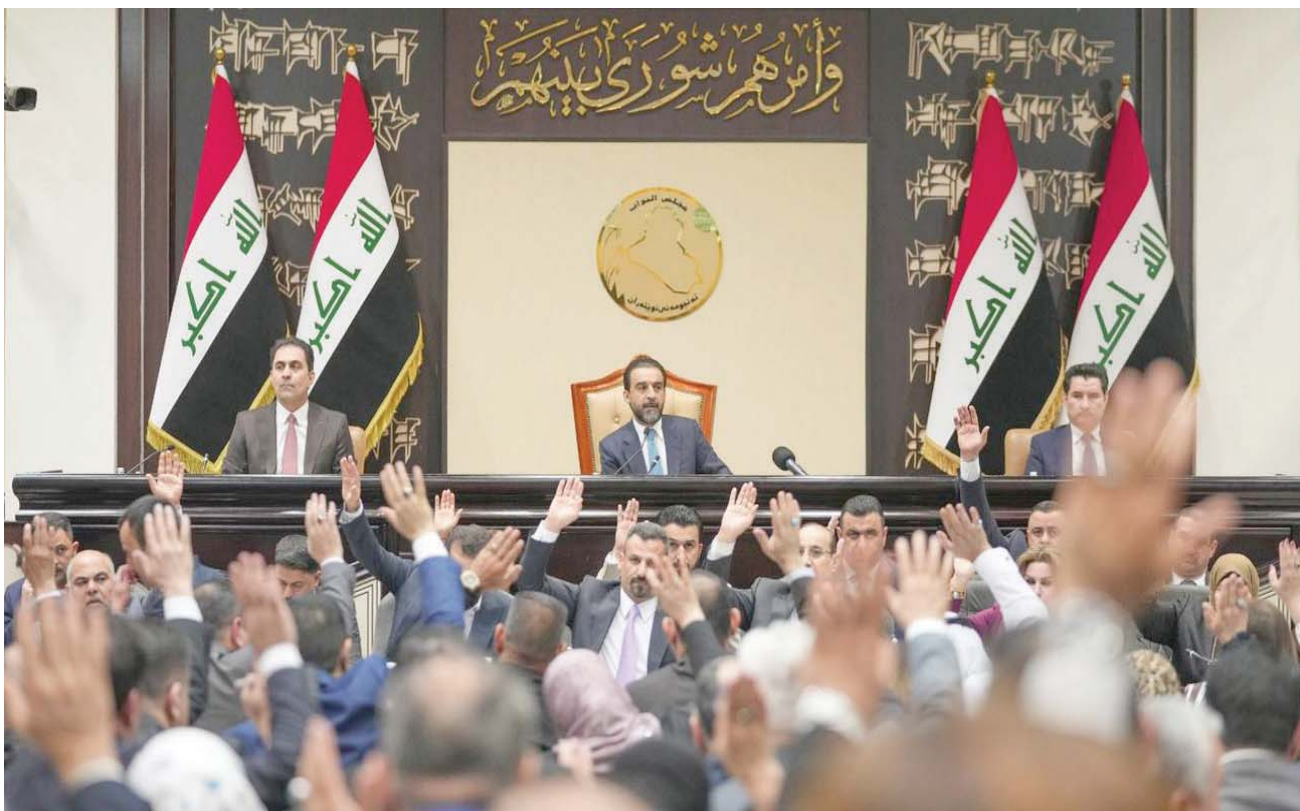
صورة نشرها موقع مجلس النواب العراقي من جلسة التصويت على مشروع قانون الموازنة العامة أول من أمس

وقال قيادي رفيع في الإطار التنسيقي «من دون شك، الموازنة التي سيصوت عليها البرلمان، لن تكون نسخة اللجنة المالية، بل النسخته الهجينة».