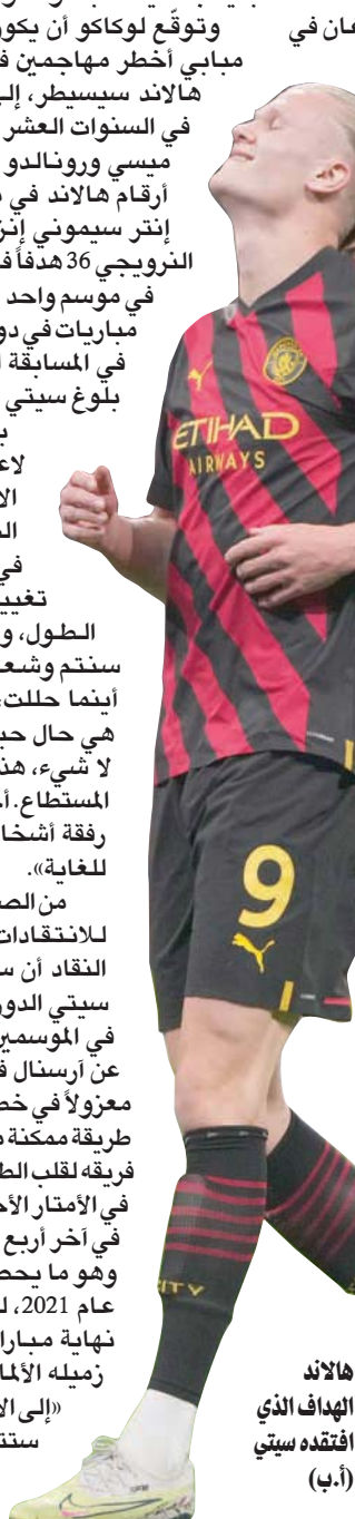
هالاند الهدف الذي افتقده سيتي (أ.ب)