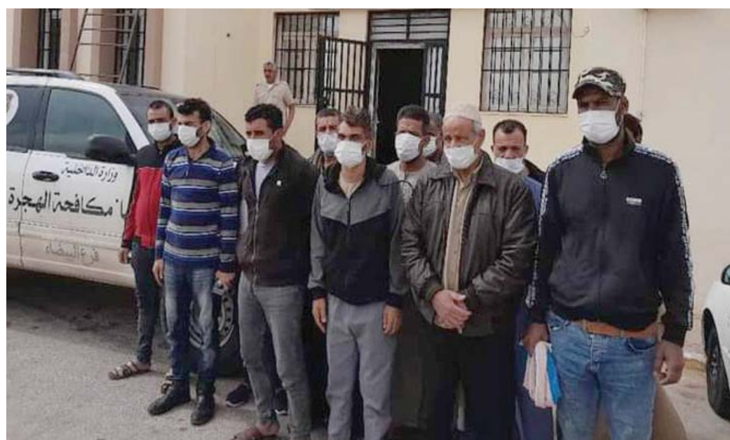
عدد من المهاجرين غير النظاميين الذين رخصهم سلطات شرق ليبيا (جهاز مكافحة الهجرة - فرع البيضاء)

الحاصلة بين مؤسسات الدولة في تأمين وحراسة الحدود البرية والبحرية، وانعكاس ذلك على أمن الحدود، ووضع الحلول اللازمة لها وتنفيذها».