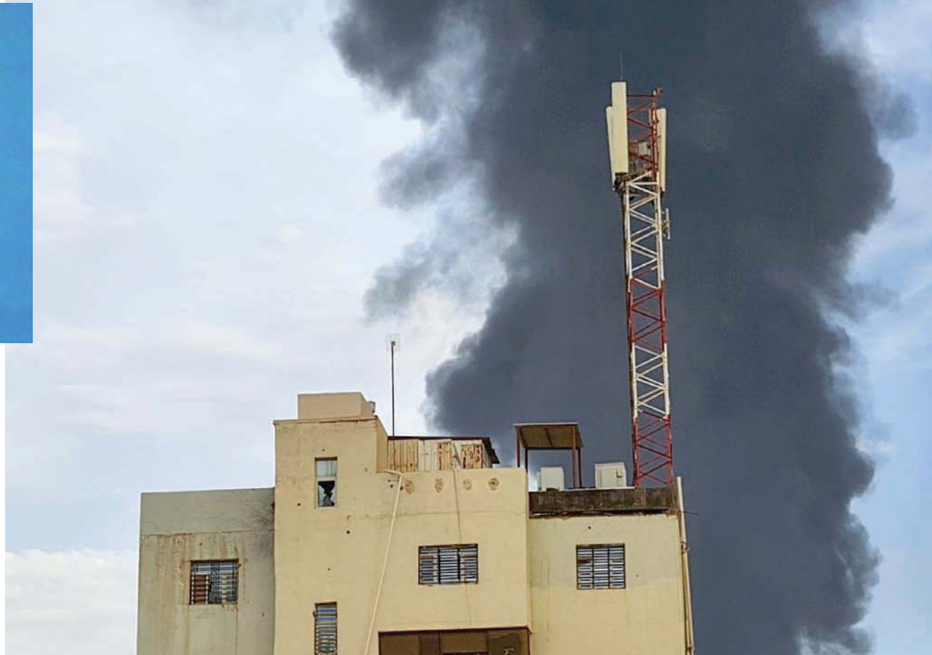
آثار المعارك خلف أحد المباني في جنوب الخرطوم

من جهة ثانية، تمسك الأمين العام للأمم المتحدة، أنطونيو غوتيريش، بموفده إلى الخرطوم، رغم رفض الحكومة السودانية. وقال المتحدث باسم الأمين العام للأمم المتحدة، الجمعة، إن اعتبار الجيش وقوات الدعم السريع موفد المنظمة الدولية