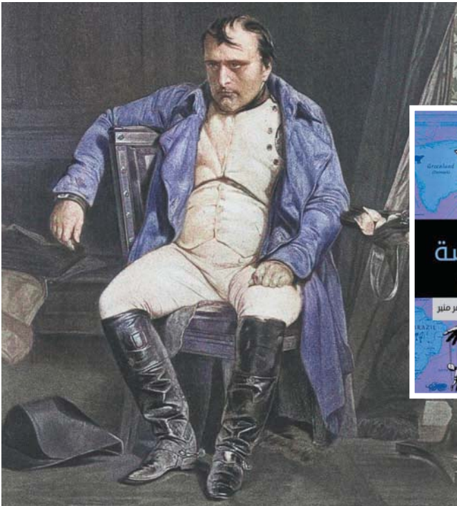
رسمه لتابليون بر يشة بول ديلاروش عام 1840 (فيتي)

ويضرب المؤلف مثلاً بما حدث في جمهورية ألمانيا الشرقية السابقة، حيث استهانت قياداتها بشكل أساسي بمشاعر الإحباط التي انتابت سكانها، فعندما ظهر رئيس البلاد إيجون كرينتس أمام كاميرات التلفزيون، في السابع من مايو (أيار) عام 1989، وزعم بجديّة تامة أن «حزب الوحدة الاشتراكي»، الذي يتراسه، حصد 98,85 في المائة من الأصوات، بنسبة بمشاركة انتخابية بلغت 98,85 في المائة، كان الكيل قد طُفح لدى مواطني ألمانيا الشرقية. كان هذا الادعاء بمثابة كذبة فجّة لا تُصدّر إلا عن متطرس. واحتجّ للمرة الأولى عدد من المواطنين، وطالبوا بمراجعة نتيجة الانتخابات. والتقى المتظاهرون في الكنائس، وجمعوا قوائم بالأسماء أظهرت أن ما لا يقل عن 10 في المائة من الناخبين صوّتوا ضد الحكومة، وأن هناك 10 في المائة آخرين لم يصوّتوا على الإطلاق؛ ونتيجة لمشاعر الضجر ظهرت حركة شعبية عارمة أدت، في نهاية المطاف، إلى سقوط سور برلين، في 9 نوفمبر 1989، وإعادة توحيد ألمانيا.