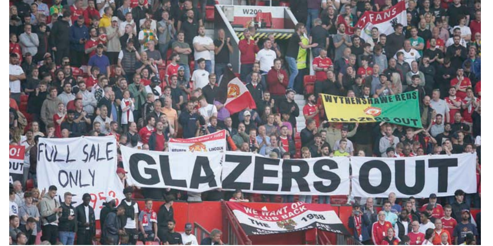
جماهير يونايتد تطالب برحيل عائلة غلايزر

ويرى الشيخ جاسم أن الماطلة في بيع النادي ستضر بحظوظ الفريق