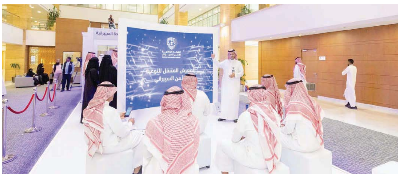
جانب من معرض متنقل للتوعية بأهمية الأمن السيبراني في السعودية