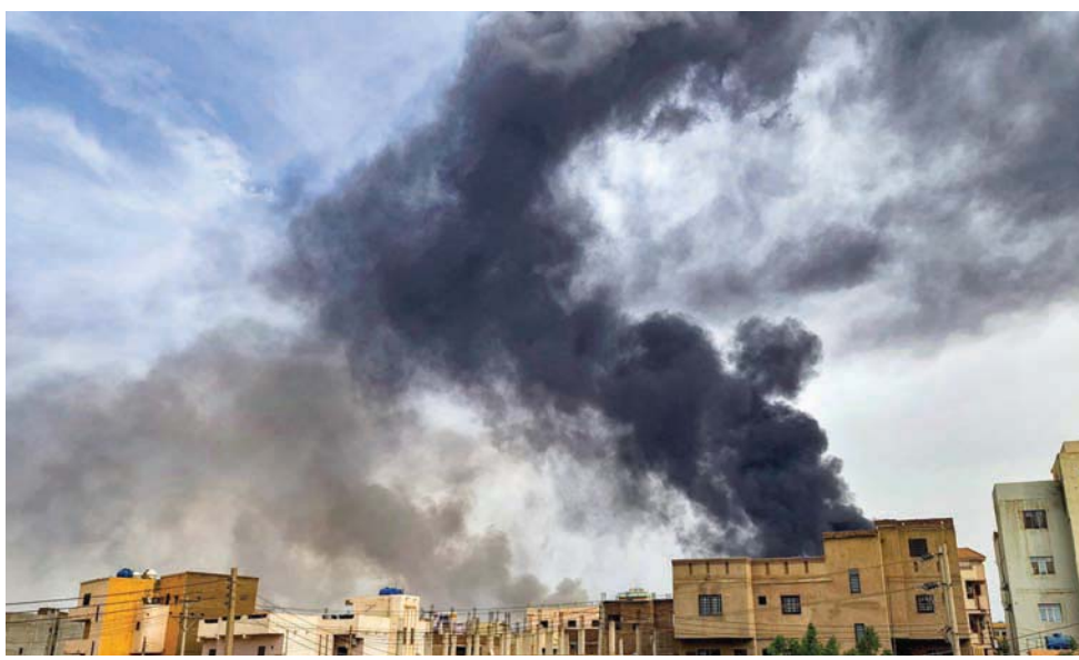
أعمدة الدخان تتصاعد من حريق في أحد المستودعات جنوب الخرطوم أمس

قوات «الدعم السريع» قامت بسرقة السيارات الدبلوماسية التابعة للسفارة الصينية، وعبثت بالمستندات وخربت أثاث السفارة.