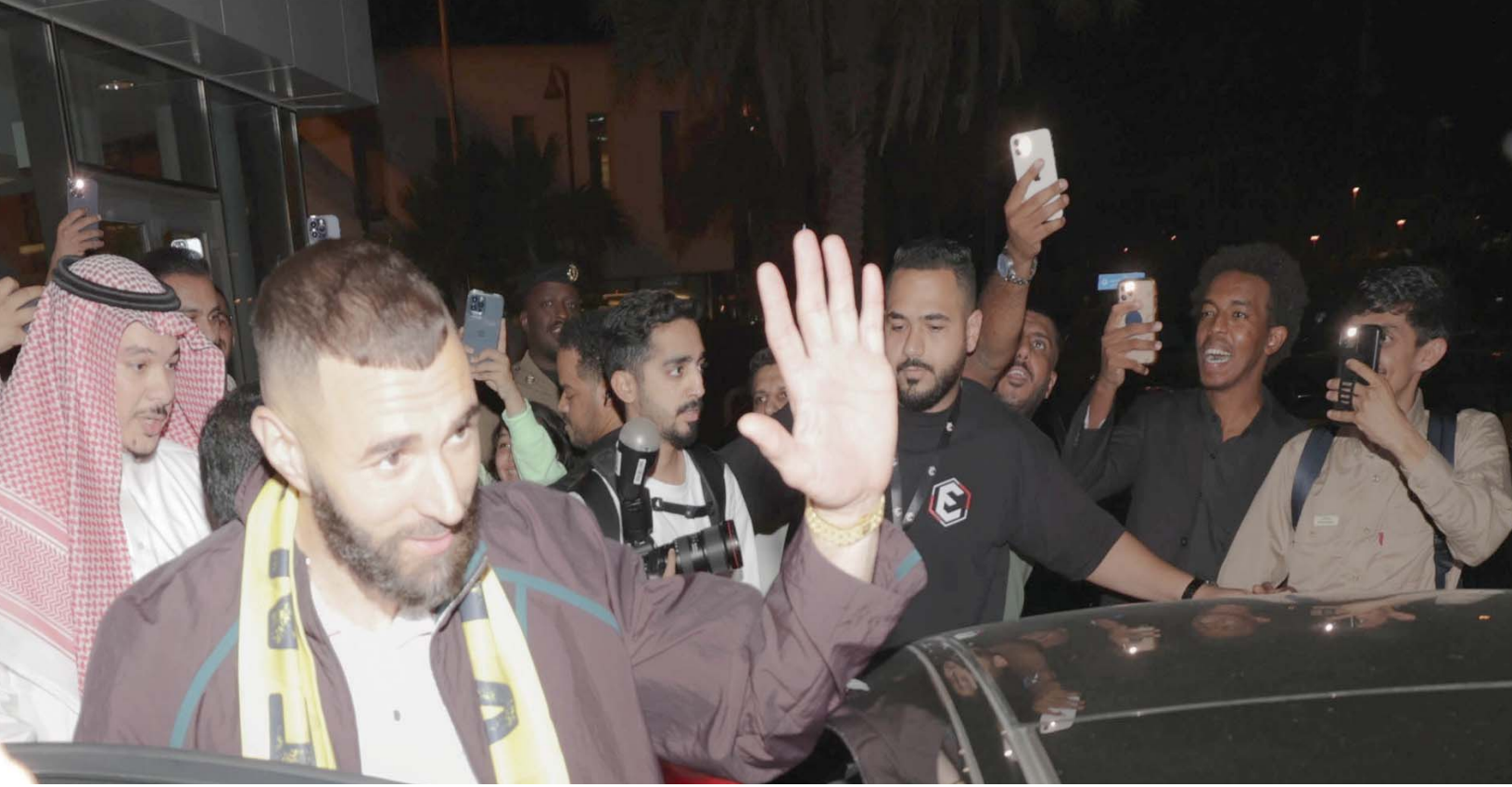
الفرنسي بنزيمية يحيي جماهير الاتحاد وهو يستعد لركوب السيارة

ويهدف ميسي، الذي قاد منتخب بلاده إلى اللقب العالمي، أواخر العام الماضي في الدوحة، إلى اللعب في مسابقة كوبا أميركا في عام 2024.