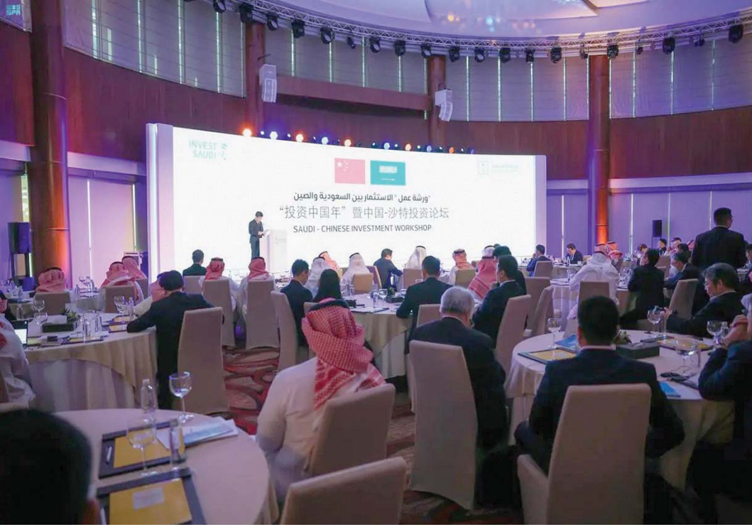
ورشة عمل «الاستثمار بين السعودية والصين» التي أقيمت مؤخراً في الرياض (الشرق الأوسط)

وفي فبراير (شباط) الماضي، أبرمت الهيئة 5 عقود مع الشركات المنفذة للمشروع بتكلفة إجمالية تتجاوز 200 مليون دولار، حيث يتضمن توريد وتركيب قواطع ومفاعلات كهربائية وأنظمة قياس وتحكم لإنشاء وتوسعة محطات التحويل في الوفرة والفاو، كما يشتمل على الخدمات الاستشارية لإعداد الدراسات البيئية والاجتماعية والإشراف على التنفيذ.