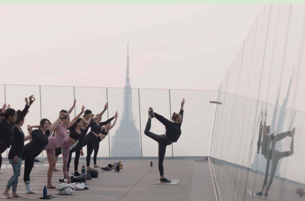
ممارسة اليوغا فوق سطح مبنى في مانهاتن