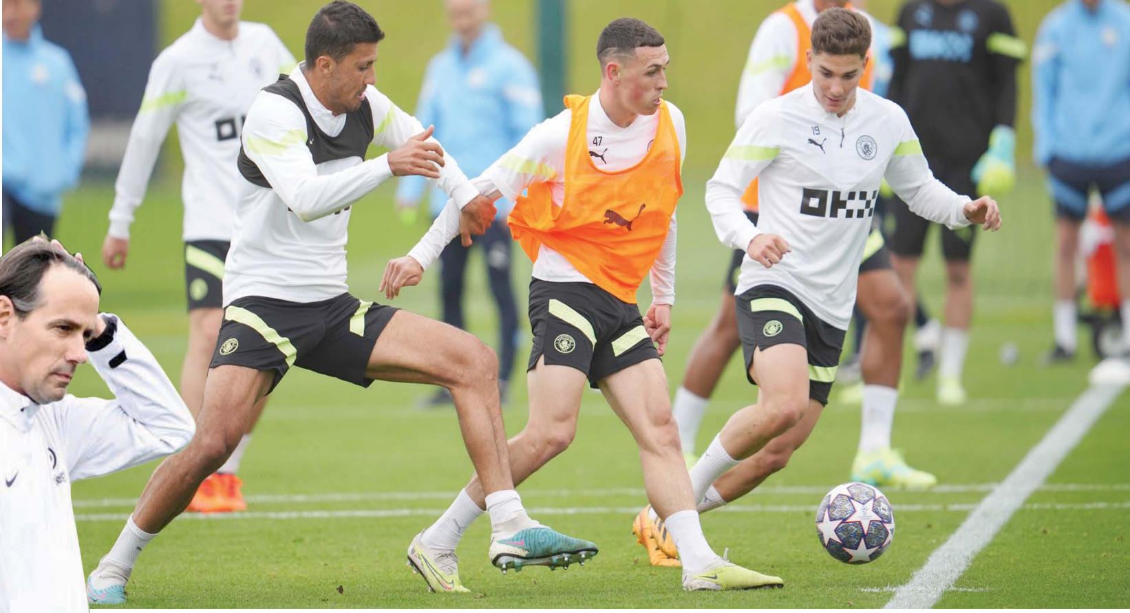
سيتي جاهز بكامل عتاده لموقعة نهائي أبطال أوروبا السبت

إنزاغي يأمل في قيادة إنتر ميلان للقب قاري جديد