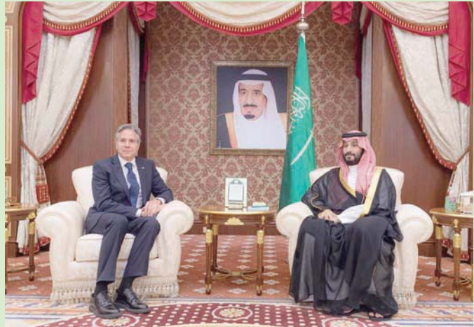
ولي العهد السعودي خلال لقائه في جدة وزير الخارجية الأمريكي أنتوني بلينكن

جدة: «الشرق الأوسط» اختتم وزراء خارجية دول مجلس التعاون الخليجي ونظيرهم الأميركي، في الرياض، أمس الأربعاء، أعمال الاجتماع الوزاري المشترك للشراكة الاستراتيجية بين الجانبين من دون صدور بيان مشترك. وقالت وزارة الخارجية السعودية إن الوزراء المشاركين بحثوا «أوجه تعزيز العمل الخليجي المشترك وسبل تطويره في مختلف المجالات، بالإضافة إلى مناقشة تكثيف العمل الخليجي الأميركي والتخسيق المشترك في العديد من القضايا الإقليمية والدولية». وأضافت أن القضايا السياسية والجهود المبذولة بشأنها.