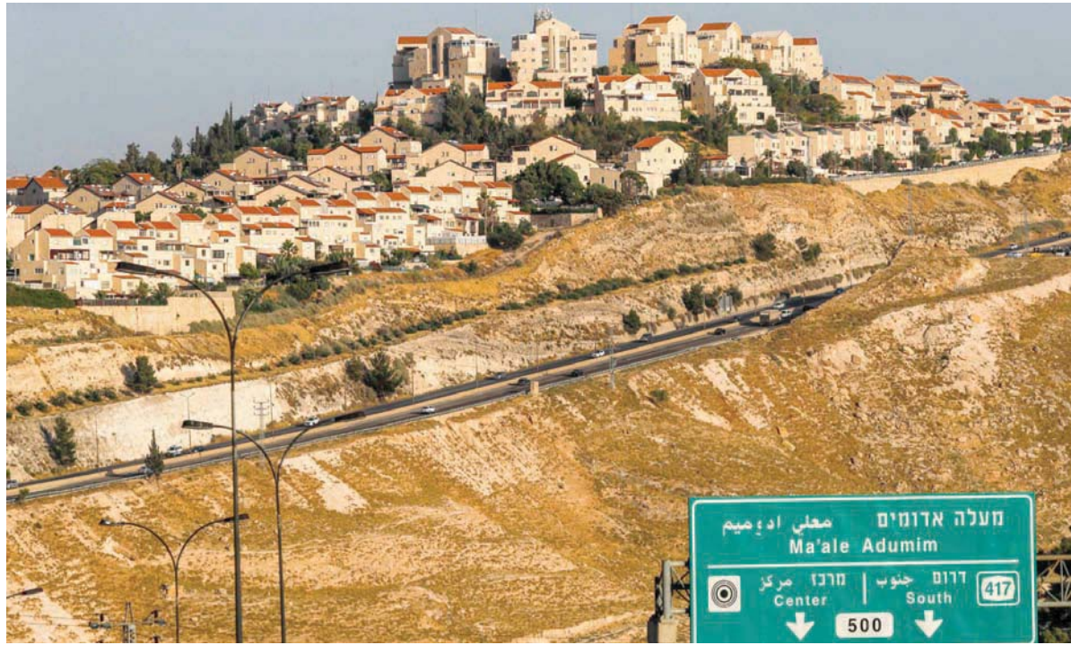
صورة تم التقاطها من ممر «إي 1» في الضفة الغربية تظهر مستوطنة «معاليه أدوميم» في يونيو 2020