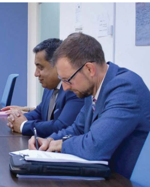
غروندبرغ مع وزير الدولة البريطاني اللورد طارق أحمد

كما التقى رئيس مجلس النواب اليمني سلطان البركاني وعرض الجهود والاتصالات التي بذلها خلال زيارته للدول المعنية بالمنطقة والإقليم، بالإضافة إلى الولايات المتحدة الأميركية والصين، وفق ما ذكره