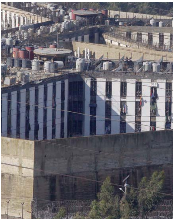
صورة أرشيفية لسجون رومية المكتظ بالسجناء

السلطات الصحية في تقديم الرعاية الطبية الوافية في الوقت المناسب إلى المحتجزين، ومن ضمن ذلك إلى الحالات التي تتطلب علاجاً طارئاً. وأجرت المنظمة بين سبتمبر (أيلول) 2022 وأبريل (نيسان) 2023 مقابلات مع 16 شخصاً، من ضمنهم سجناء وأفراد عائلات أشخاص توفوا في الحجز، واستعرضت تقارير طبية عدة، علاوة على صور ومقاطع فيديو التقطها أشخاص في السجن. وقد بعثت منظمة العفو الدولية برسائل إلى وزارتي الداخلية والصحة تضمنت أسئلة حول الوفيات في الحجز. فأرسلت الوزارتان رديهما اللذين أدرجا في التحقيق. وأبلغت عائلات ثلاثة من المتوفين «منظمة العفو الدولية» أن موظفي السجن تجاهلوا شكوى المحتجزين وأعراضهم قبل وفاتهم؛ ما أحرّ تقديم العلاج لهم ونقلهم إلى المستشفيات، وأدى إلى تدهور حالاتهم الصحية.