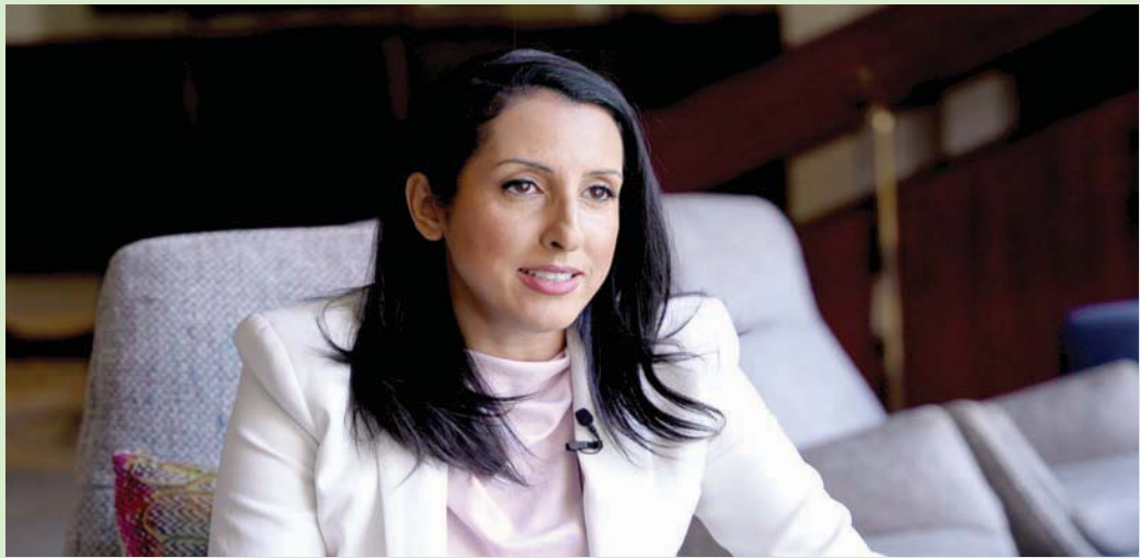
هالة غريب المتحدثة الإقليمية باسم «الخارجية» الأميركية

نحن نشكر السعودية على أن هناك تحالفاً لهزيمة «داعش» هنا في الرياض، الوزير سيحضر غداً، هذا تنسيق مهم جداً ليس بين الولايات المتحدة والمملكة العربية السعودية فحسب، بل هناك أكثر من 80 دولة في هذا التحالف، وكذلك سيكون هناك أكثر من 30 وزيراً في الاجتماع، التنسيق أهم شيء بالنسبة لمحاربة الإرهاب وهزيمة «داعش» الدائمة،