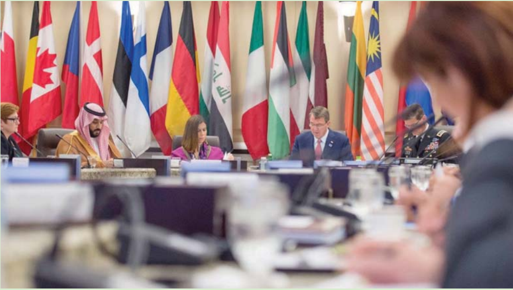
وصل عدد أعضاء «التحالف الدولي لمحاربة داعش» إلى 85 دولة ومنظمة دولية