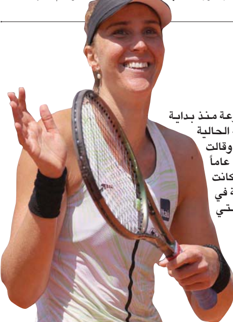
حداد مايا أول برازيلية تصل إلى نصف نهائي بطولة كبرى في عصر الاحتراف (أ.ف.ب)

وكانت أنس تلعب في بطولة الدور قبل النهائي في بطولة كبرى لثالث مرة في أقل من عام، لكن أمانها تحطمت أمام المصنفة 14 التي تلعب باليد اليسرى، والتي قاتلت بشجاعة لتصل