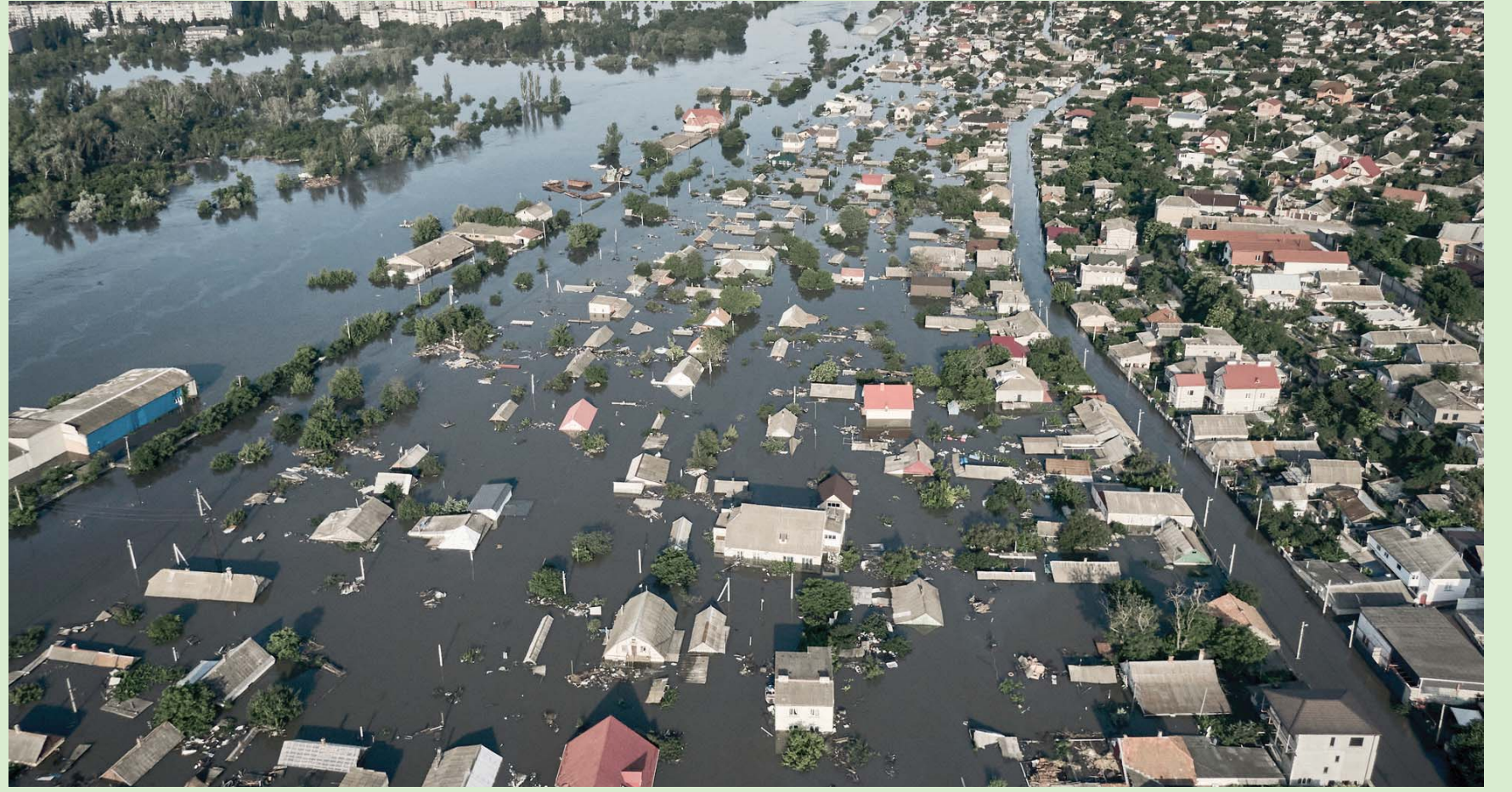
المياه تغمر مناطق واسعة في خيرسون أمس جراء تفجير سد كاخوفكا

مفاعل تشيرنوبيل النووي في العهد السوفياتي، جاء الإعلان الروسي عن تدمير القوات الأوكرانية خطاً رئيسياً لإمدادات الأونيا ليعزز المخاوف من انتقال الممارك بين الطرفين الروسي والأوكراني لاستهداف منشآت استراتيجية شديدة الأهمية والخطورة بالنسبة إلى البلدين. وقالت وزارة الدفاع الروسية في بيان إن «مخربين أوكرانيين فجروا الاثنين خط أنابيب الأونيا أحد شروط روسيا كجزء من تنفيذ صفقة الحبوب. وأشارت وزارة الدفاع إلى «سقوط ضحايا بين المدنيين وتم تزويدهم بالمساعدة الطبية. في حين لم يصب أي من العسكريين الروس». وكان خط الأنابيب الذي أقيم في أواخر سبعينات القرن الماضي، يضح حوالي 2,5 مليون طن من المواد الخام سنوياً. لكن تم إيقاف الإمدادات عبره منذ اندلاع الأعمال القتالية في أوكرانيا، ويعد مطلب إعادة فتح خط أنابيب الأونيا أحد شروط روسيا كجزء من تنفيذ صفقة الحبوب.