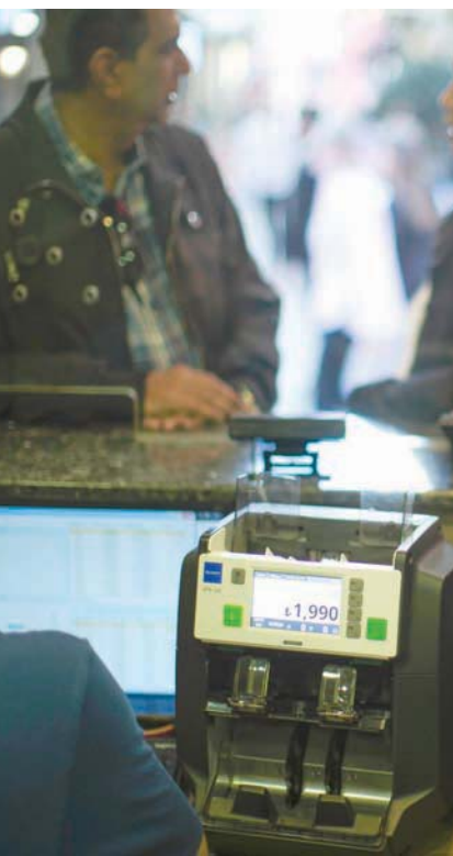
رجل وامرأة في مكتب صرافة بإسطنبول بينما تهاوت الليرة التركية بنحو 7% يوم الأربعاء

وأضافت المنظمة «في أعقاب الزلزال، ستستمر السياسة النقدية والمالية في دعم الاقتصاد، غير أن تحديث توقعات التضخم لا يزال صعباً. ولذلك ينبغي تشديد السياسة النقدية مع اختيار توقيت زيادات أسعار الفائدة بعناية، على أن يصحب ذلك الإعلان بوضوح عن التحركات المستقبلية». وأعلن إردوغان عن تشكيلة الحكومة الجديدة مطلع هذا