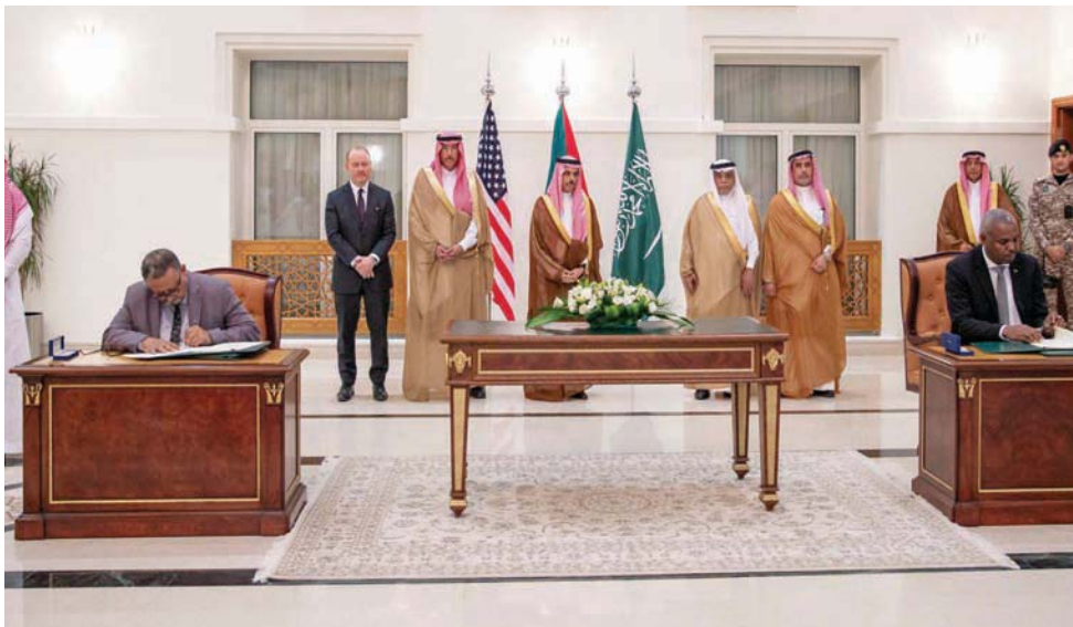
وزير الخارجية السعودي إلى جانب ممثلين عن طرفي النزاع السوداني خلال توقيع «اتفاق جدة» في 21 مارس

الولايات المتحدة والسعودية ستقدمان مقترحاً بهدنة بين الجيش وقوات الدعم السريع لمدة 24 ساعة «لاختبار مدى التزام الطرفين بنودها». وأكد إبراهيم في تصريحات خاصة لـ«وكالة