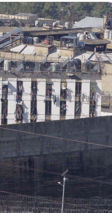
صورة أرشيفية لسجون رومية المكتظ بالسجناء

وتظهر الأرقام التي شاركتها وزارة الداخلية مع «منظمة العفو الدولية»، ارتفاع معدلات الوفاة من 14 في 2015 و 18 في 2018 إلى 34 في 2022. واثقت السلطات باللوم عن تدهور صحة السجناء على الأزمة الاقتصادية التي تعصف بلبنان منذ العام 2019، وأدت الأزمة إلى وفاة 3 سجناء، في حين طاولت الموظفين والعسكريين والخدمات الحكومية. واعتبرت المنظمة أنه «يجب على السلطات القضائية إجراء تحقيقات سريعة وتزبيحة وفعالة في حالات الوفاة كافة في الحجز لتحديد مدى إسهام سوء تصرف موظفي السجن أو إهمالهم في حدوث هذه الوفيات، ومساءلة أي شخص يتبين أنه يتحمل مسؤولية». وقالت المنظمة في تقرير نشرته الأربعاء: «يجب أن تكون هذه الزيادة الحادة في الوفيات جرس إنذار للسلطات اللبنانية، بحيث تتعاون مع المجتمع الدولي على تحسين أوضاع السجناء، بما في ذلك الرعاية الصحية». كما أكدت أنه «ينبغي على السلطات أيضاً التحقيق في مدى ارتباط الزيادة الحادة في الوفيات بعوامل بنوية، مثل الاكتظاظ وقلة الموارد الوافية والإفلات من العقاب على المعاملة السيئة، وهي عوامل تفاقمت جميعها بفعل الأزمة الاقتصادية». وازدادت حدة الاحتجاز في السجون اللبنانية في السنوات الأخيرة. وأصبحت تتجاوز طاقتها