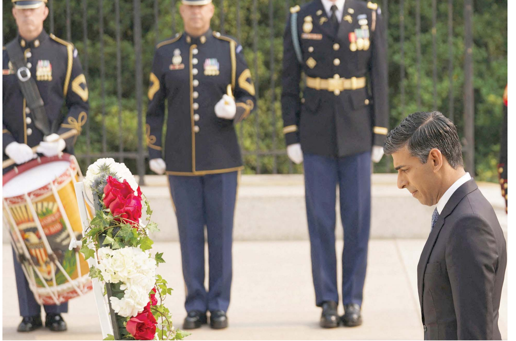
سوناك يضع إكليلاً من الزهور في مقبرة أرلنغتون الوطنية الأربعاء