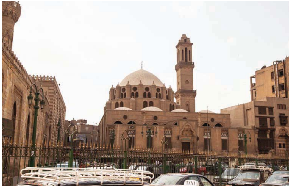
مئذنة مسجد محمد بك أبو الذهب (موقع القاهرة الإسلامية التابع لمكتبة الإسكندرية)

مئذنة مسجد أحمد بن طولون (موقع القاهرة الإسلامية التابع لمكتبة الإسكندرية)