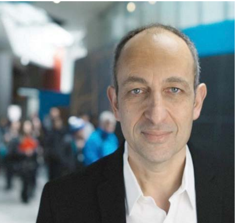
واشنطن: علي بردي

أسدى مدير معهد البيانات والأنظمة والمجتمع لدى معهد ماساتشوستس للتكنولوجيا «أم أي تي»، البروفيسور منذر دحلة، للصحف حيال كيفية كتابة هذا الحوار معه من خلال الاستعانة عمداً بنظام «تشات جي بي تي» الذي يعكس القدرات المذهلة التي وصل إليها الذكاء الاصطناعي، وأفاق استخداماته المستقبلية. وعلى غرار الصحافي، ساوره الفضول في النتيجة المحتملة تضمنت نصائح هذا العالم الأميركي الفسطيني الأصل ضمن أمور أخرى- إلا أقدم مثلاً على إعطاء المقابلة كاملة لكي يعيد «تشات جي بي تي» كتابتها. «لو فعلت ذلك، لأعطاك نصاً مختلفاً لا يشبه الحوار»، مضيفاً أن «الأفضل أن تعطيه مقاطع صغيرة لإعادة صوغها».