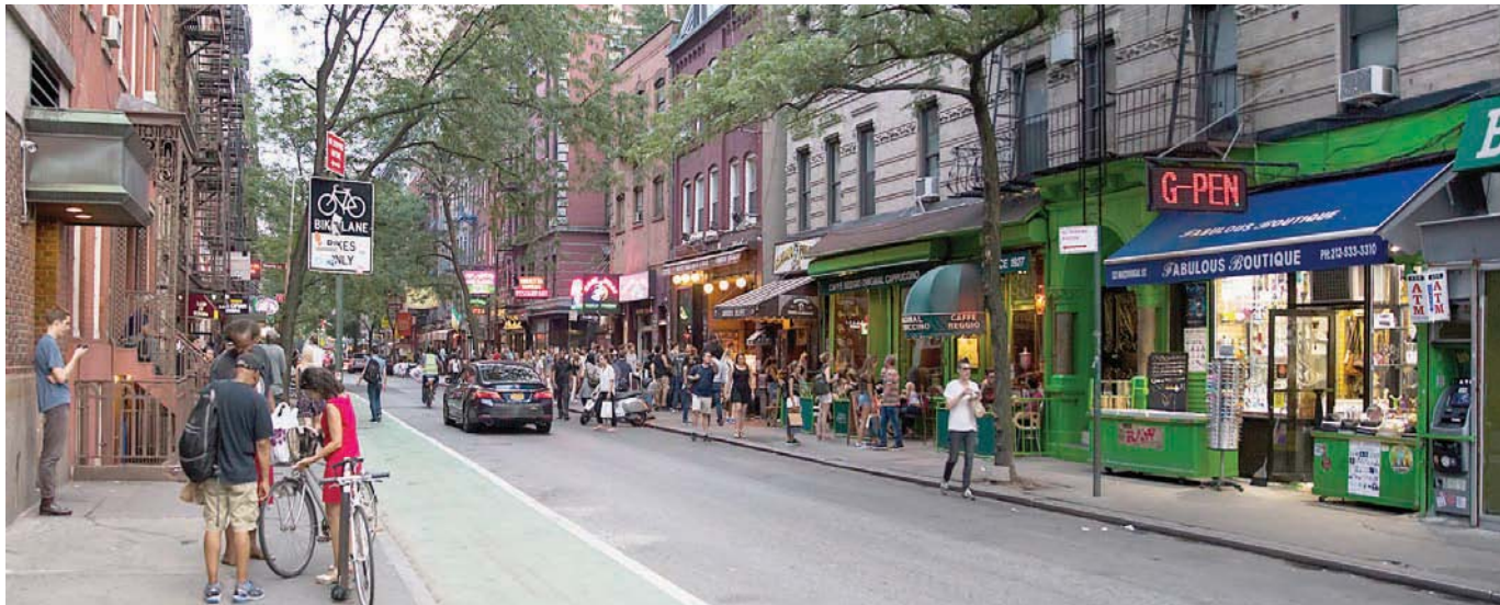
«ويست فيليديج» في نيويورك من المناطق الجميلة والمليئة بالمطاعم