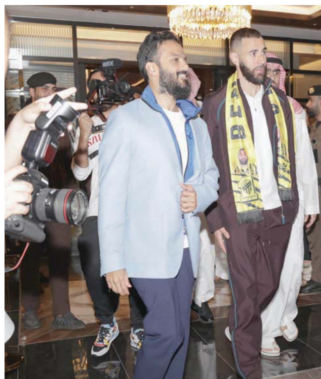
بنزيمية وأثار لحظة وصولهما إلى مطار الملك عبد العزيز»

وقال المصدر، الذي فضل عدم كشف هويته كونه غير مخوّل للتحدث للإعلام، إن العقد مع لاعب