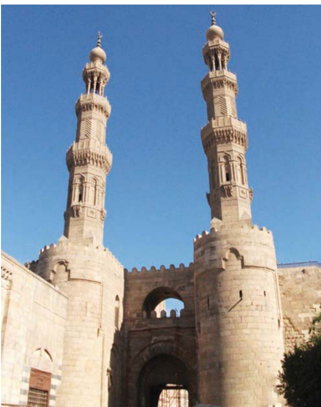
مئذنة مسجد المؤيد شيخ (باب زويلة) (موقع القاهرة الإسلامية التابع لمكتبة الإسكندرية)

الجمالي في عهد الخليفة المستنصر بالله الفاطمي، عام 485هـ-1092م. وترجع لاسمها بهذا الاسم نسبة إلى قبيلة زويلة البربرية التي جاءت مع قائد الجيوش الفاطمية جوهر