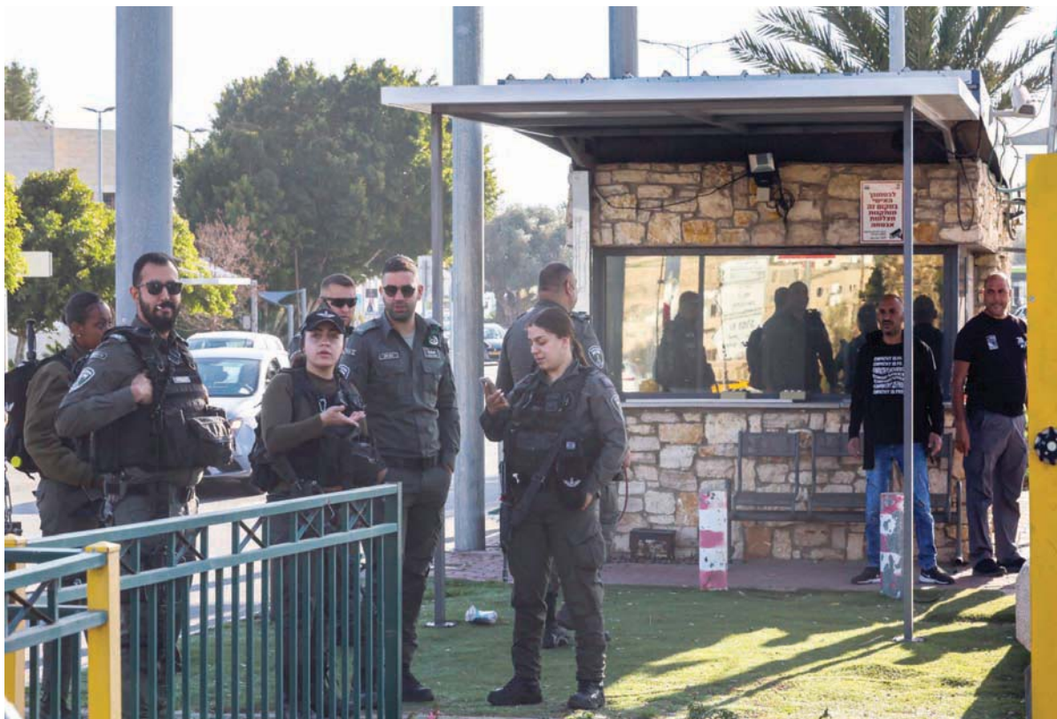
قوات إسرائيلية تؤمن مدخل مستوطنة معاليه أدوميم في الضفة في أعقاب هجوم فبراير الماضي

دفعت إسرائيل إلى طاولة النقاش خطة البناء الاستيطاني الأكثر حساسية في الضفة الغربية، المعروفة باسم «إي 1»، وهي الخطة التي طالما تاجل نقاشها عدة مرات، بسبب معارضة الولايات المتحدة والمجتمع الدولي الشديدة، للمشروع الضخم الذي سيُقسّم الضفة الغربية إلى نصفين ويمنع أي تواصل جغرافي للدولة الفلسطينية المنشودة. وحددت لجنة التخطيط المركزية في الإدارة المدنية الإسرائيلية المسؤولة عن الضفة الغربية، في اجتماع لها يوم الاثنين، مناقشة الخطة التي تهدف إلى ربط القدس بمستوطنة معالي أدوميم الضخمة وسط الضفة الغربية.