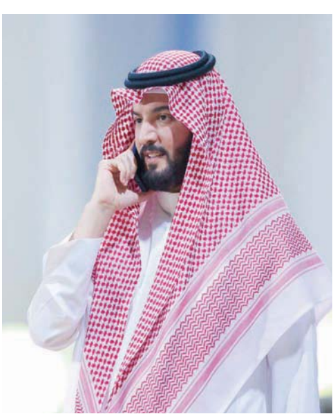
بن نافل أزال منصبه رئيساً لنادي الهلال على «تويتر»

خلال إعادة النظر في قيمة العضوية بعد سنة من تاريخ التغيير. ويتم التنسيق مع مجلس إدارة الشركة على اقتراح لائحة مزايا كل عضو، على أن يتم رفعها لوزارة الرياضة لاعتمادها. ووفقاً للقوة التصويتية في الجمعية العمومية، فقد نصت اللائحة على أنه لغرض احتساب القيمة الصوت الواحد بمائة ريال، ويتم دفعها للمؤسسة، ويجوز لعضو المؤسسة زيادة عدد أصواته والحصول على صوت واحد مقابل كل مائة ريال يدفعها، شريطة أن يقدم العضو خلال 10 أيام من تاريخ سداد القيمة طلباً للمؤسسة باحتساب أصواته له