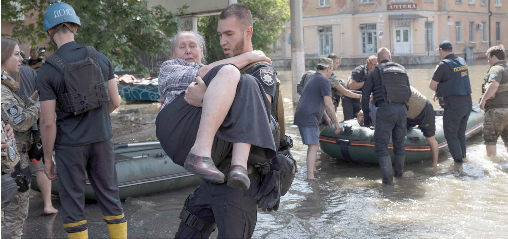
مسعف يحمل أوكرانية أثناء إخلاء مناطق في خيرسون غمرتها مياه السد

في غضون ذلك، جاء إعلان وزارة الدفاع الروسية عن تفجير خط إمدادات الأومونيا قرب خاركيف ليؤكد انتقال المعارك بين الطرفين الروسي والأوكراني لاستهداف