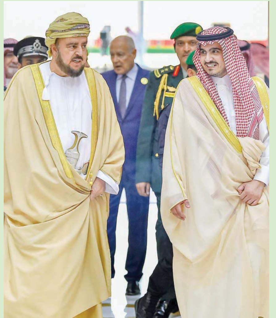
نائب رئيس الوزراء العماني أسعد بن طارق آل سعيد لدى وصوله إلى جدة

تحويل على أن تنعكس نتائجها إيجاباً على معظم الملفات الساخنة