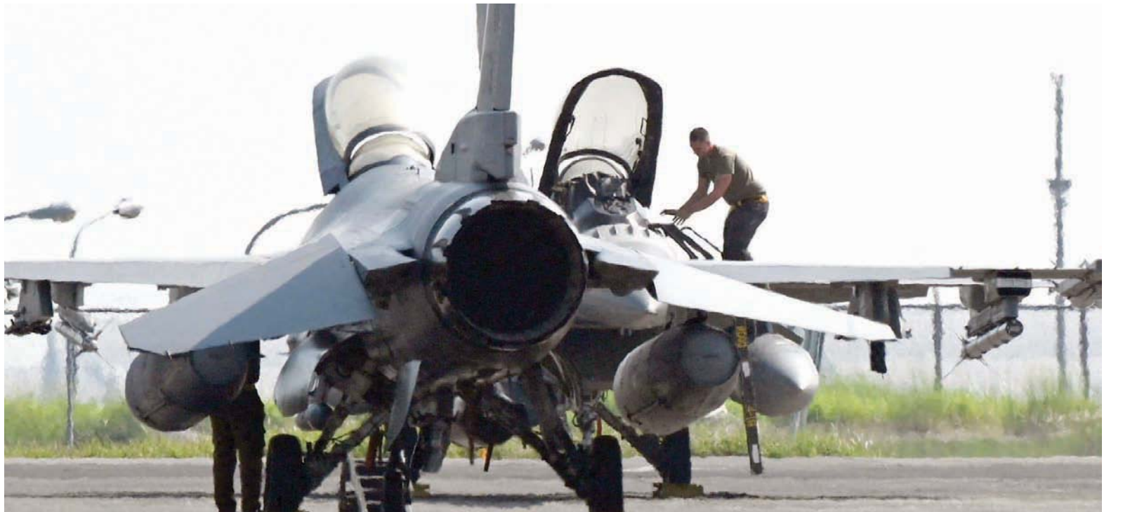
إحدى طائرات «إف 16» التي تصر كيف على حاجتها لها

واشنطن: إيلي يوسف كبيف - موسكو: «الشرق الأوسط»