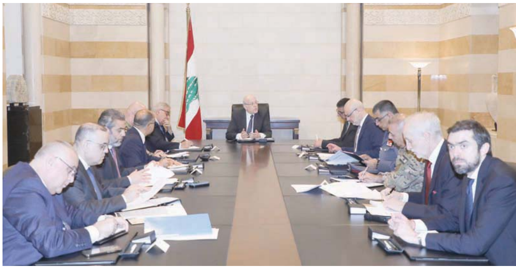
صورة أرشيفية للرئيس نجيب ميقاتي متراً اجتماعاً وزارياً - أمنيياً في السراي (دالاتي ونهرا)

حماية، كما علمت «الشرق الأوسط»: «من أين يؤتى بهذه الكميات الكبيرة من الكبتاغون إلى لبنان؟ وهل من معامل في لبنان تكفي لتصنيعها وتهريبها إلى الخارج؟ خصوصاً أن القوى الأمنية والعسكرية والجمارك تمكنت من مصادرة عشرات ملايين حبات الكبتاغون».