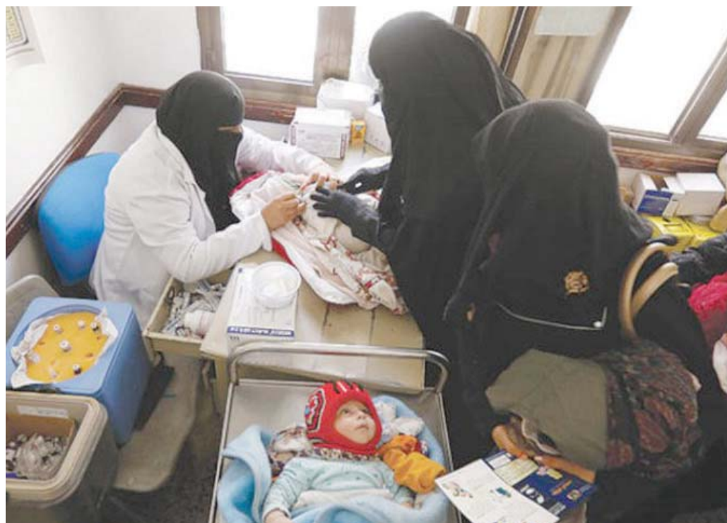
رضع يتلقون التحصين في مركز طبي بصنعاء

وكشفت إحصائية صادرة عن القطاع الصحي الذي تديره الجماعة في صنعاء، أواخر العام الماضي، عن تسجيل وفاة 80 طفلاً من حديثي الولادة يومياً في المناطق تحت سيطرتها، منهم 2200 مولود توفوا في مستشفى السبعين للأمومة والطفولة خلال السنوات الماضية. وتقول مصادر طبية في صنعاء إن ذلك ناجم عن استمرار فساد قادة الجماعة وإمعانهم في استهداف القطاع الصحي بالدهم والإغلاق وفرض الإتاوات غير القانونية على ما بقي من المنشآت والمراكز الصحية التي ارتبطت ارتباطاً مباشراً بصحة