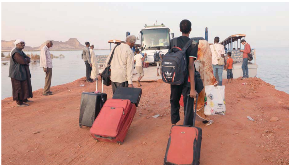
سودانيون يستعدون لركوب عتارة على نهر النيل إلى أبو سميل جنوب مصر أمس

وقال برنامج الأغذية العالمي، التابع للأمم المتحدة، إنه يعكف على تكثيف عملياته في 6 ولايات على الأقل في السودان، لمساعدة 4.9 مليون شخص معرضين للمخاطر، فضلاً عن مساعدة أولئك الذين يفرون إلى تشاد ومصر وجنوب السودان.