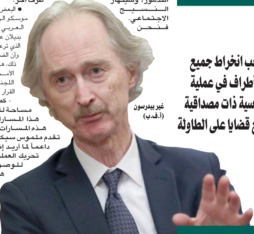
غير بيدرسون

بديلاً عن مسار جنيف الذي ترعاه الأمم المتحدة، وأن الضحية الأكبر لكل ذلك، هي عملية ترعاهما الأمم المتحدة إزاء اللجنة الدستورية أو القرار 2254؟ - كما قلت، هناك مساحة للتوفيق بين هذه المسارات. إذا بدأت هذه المسارات في تحقيق تقدم ملموس سيكون هذا الأمر داعماً لما أريد إنجاز، وهو تحريك العملية السياسية للوصول إلى بيئة هادئة وأمنة وحايدة يمكننا من التقدم في العملية السياسية.