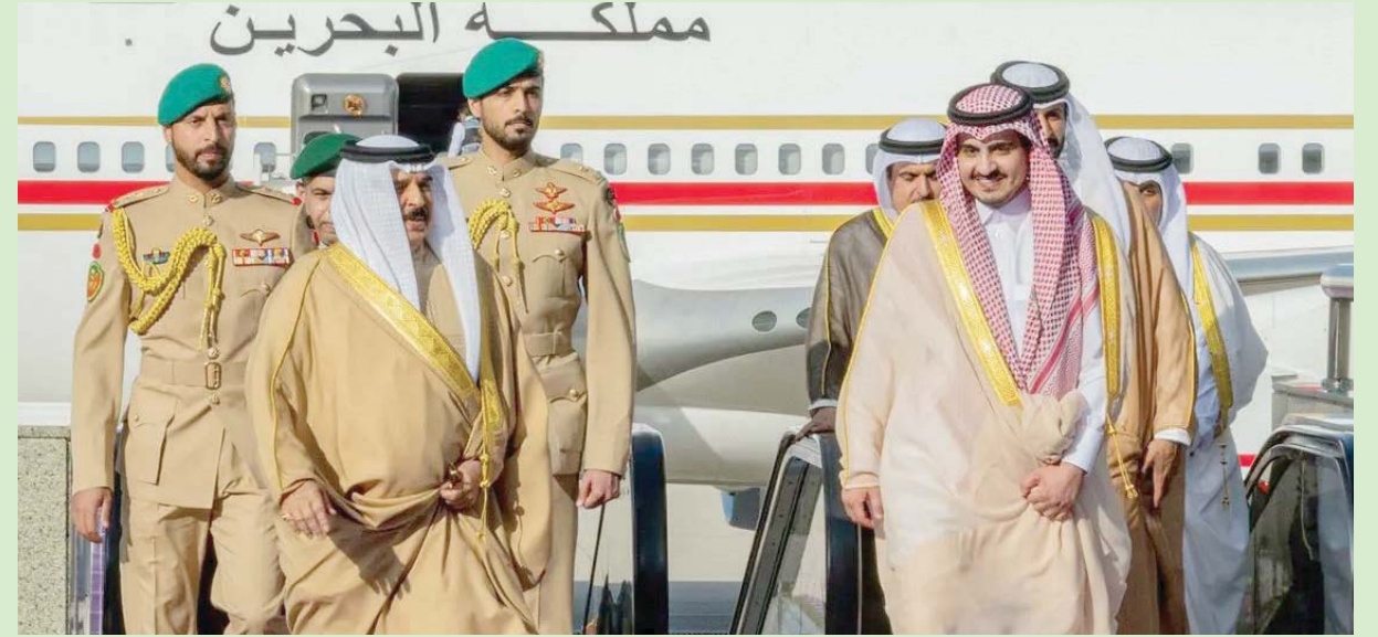
الملك حمد بن عيسى لدى وصوله إلى جدة للمشاركة في القمة العربية