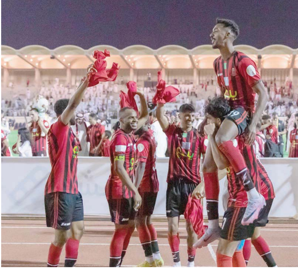
فرحة لاعبي الرياض بالعودة