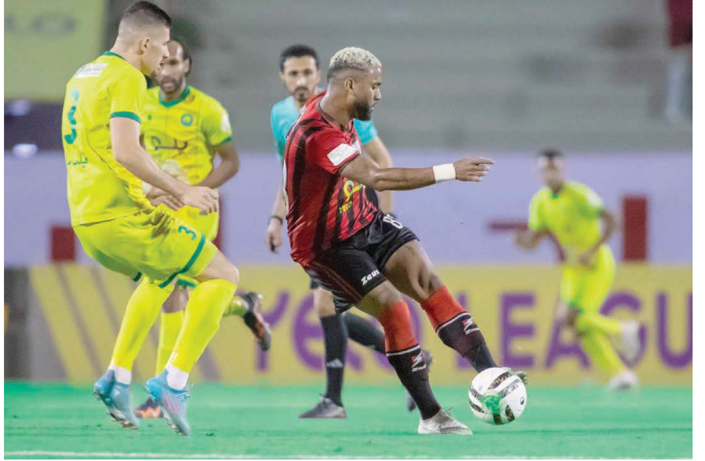
من لقاء نادي الرياض والعروبة

نوفو، لتنجح إدارة النادي في اختيار المدرب المثالي، وتحقيق خبطة موفقة بين المحترفين والمحليين، ليتاهل الفريق رسمياً إلى دوري الكبار ويعود إلى الواجهة بعد غياب طويل. واشتهر فريق الرياض بلقب «مدرسة السطى» في الثمانينات والتسعينات ويعُد مهاجمه التاريخي فهد الحميدان أحد أبرز نجوم كرة القدم السعودية على صعيد الهادفين؛ إذ يصف ضمن أفضل خمسة لاعبين سجلوا في الدوري السعودي الممتاز في فترة الثمانينات ومطلع التسعينات. كما تميزت صفوفه حينها بنجوم كبار أمثال ناصر الدوسري الشهير بسدوس، وعبد الله الضعبان، وخالد القروني، ومحمد القاضي، وياسر الطايفي، ومحمد السبيبت، وأحمد زايد وشقيقه حارس المرمى مبروك زايد. وكان فريقاً لا يشق له غبار في الدوري السعودي بسبب أسلوب لعبه الجميل اللافت لأنظار المشجعين، حيث مهارة لاعبيه وثنائهم للسلس للكرة، علماً أنه فاز بكأس ولي العهد عام 1994 بعد فوزه على الشباب بعد أن أفضى النصر والاتحاد في نصف وربع النهائي كما كان قريباً من الفوز بالدوري السعودي عام 1994، لكنه خسر في ما يسمى بالمربع الذهبي أمام النصر بهدف دون مقابل.