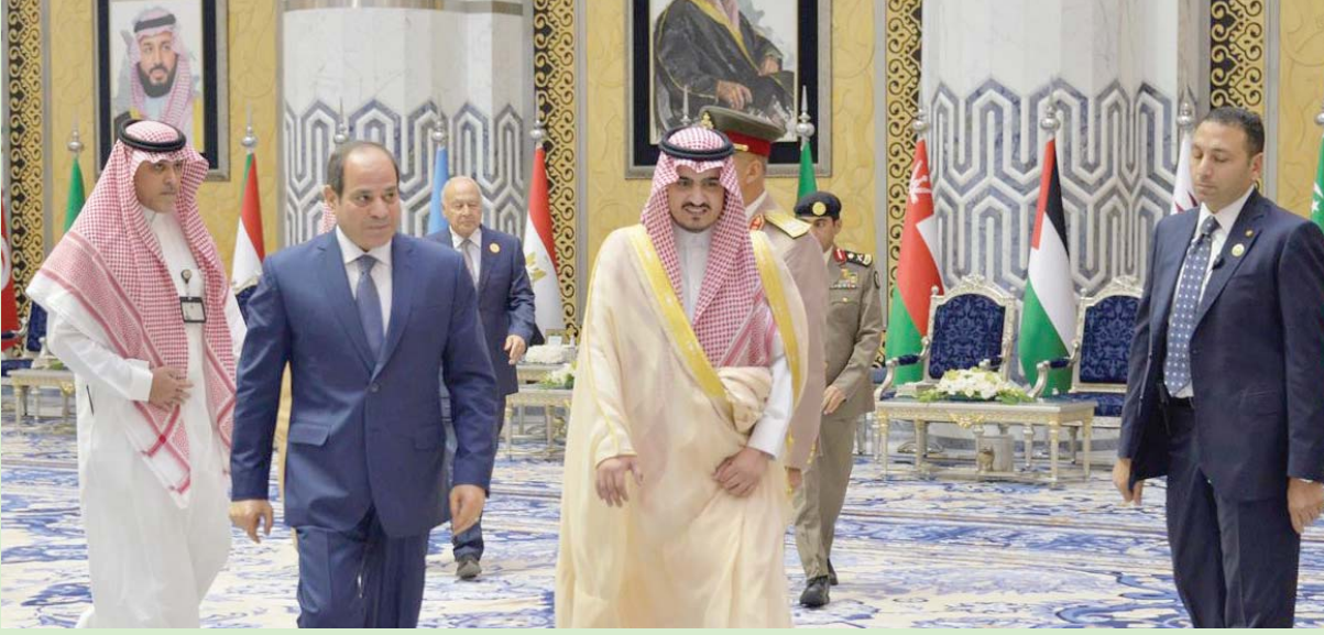
وصول الرئيس المصري إلى جدة للمشاركة في القمة العربية