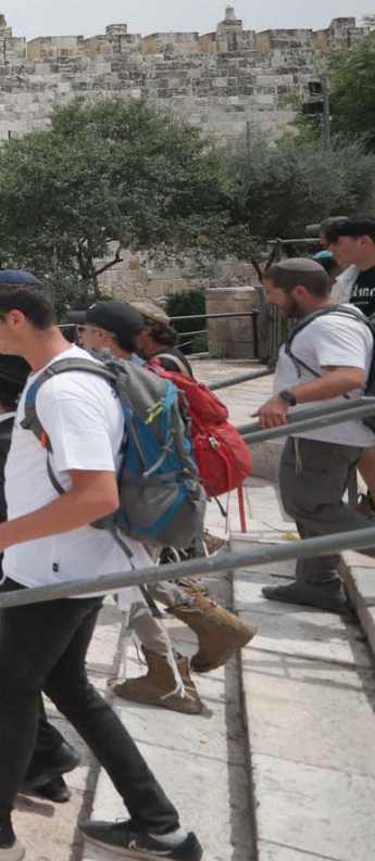
«مسيرة الاعلام» لليمين المتطرف في القدس القديمة ذات الأغلبية الفلسطينية

رفع المتطرفون الإسرائيليون مستوى التوتر إلى أقصاه، في «يوم القدس» الذي احتفلوا فيه «بتوحيد» المدينة، (احتلال الشق الشرقي منها يونيو/حزيران 1967)، باقتحامات وازدحاماً وأعضاء كنيسة، ثم مسيرة اعلام ضخمة انتشر معها الآلاف منذ الصباح في شوارع المدينة والبلدة القديمة يحملون الاعلام الإسرائيلية ويؤذون رقصات استفزازية. واقتحم نحو 1000 مستوطن المسجد الأقصى، منذ ساعات الصباح الباكر على شكل مجموعات متتالية، وراحوا يتجولون في ساحات المسجد ويؤذون طقوساً تلمودية ويغنون ويلتقطون الصور، في مشهد استفزازي استمر ساعات. وقالت دائرة الأوقاف الإسلامية في القدس «إن 923 مستوطناً اقتحموا المسجد»، صباح الخميس، وشوهه وزير النقب والجليل، المتطرف، يتسحاق فاسرلاوف، يقتحم المسجد بعد اقتحام شارك فيه الحاخام المتطرف يهودا غليك، ووزعة وزير الأمن القومي المتطرف إيتامر بن غفير، وعضو الكنيست يتسحاق كوزر.