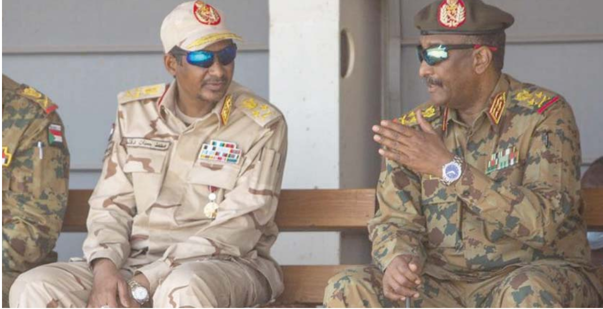
البرهان و«حميدتي» في أحد لقاءاتهما قبل اندلاع النزاع

إلى ذلك، قال بوغدانوف إنه «لا توجد حاجة لإجراء جديد للروس من السودان»، وأضاف أن موسكو سوف تعمل وفقاً للوضع، وهناك دائماً إجراءات أمنية احتياطية إذا دعت الحاجة. وكانت موسكو قد نذرت تقارير غربية عن انخراط مجموعة «فاغنر» في القتال بين الأطراف السودانية، لكنها أكدت أنه «يمكن للسودان الاستفادة من خدمات المجموعة»، وقال بوغدانوف «فاغنر» يفغيني بريغوجين، في وقت سابق، إنه مستعد لمساعدة الأطراف السودانية إذا طلب منه ذلك، مضيفاً أن لديه «علاقات جيدة مع كل الأطراف، ما يجعله وسيطاً مقبولاً».