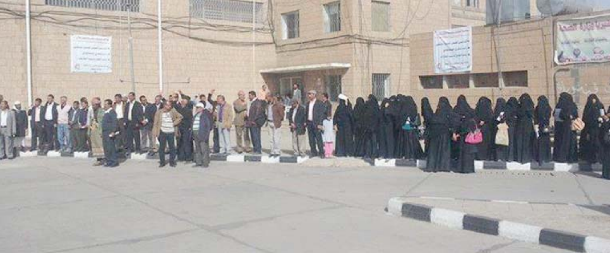
جانب من وقفة احتجاجية سابقة نظمها موظفو الصحة في صنعاء تنديداً بفساد الحويثيين