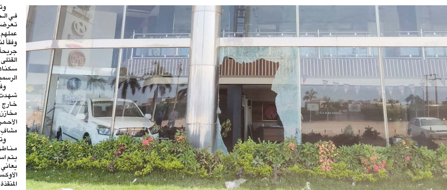
أحد المباني التي تعرضت للنهب في جنوب الخرطوم

وتقول نقابة الأطباء السودانيين إن 66 بالمائة من مستشفيات البلاد الخاصة في المناطق القريبة من الاشتباكات توقفت عن الخدمة. فمن أصل 89 مستشفى أساسياً في الخرطوم والولايات توقفت عن الخدمة 59 مستشفى، و30 مستشفى فقط تعمل بشكل كامل أو جزئي، بعضها يقدم خدمة إسعافات أولية فقط، وهي مهددة بالإغلاق أيضاً نتيجة نقص الكوادر والإمدادات الطبية والخباز والمائي والكهربائي.