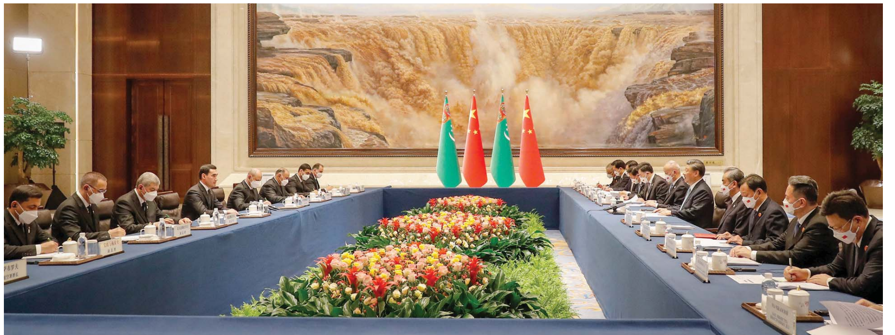
استقبل الرئيس الصيني شي جينبينغ وكبار مسؤوليه نظراءهم في تركمانستان على هامش قمة الصين ووسط آسيا التي تستضيفها مدينة شيان (ب.أ.)