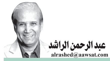
عبد الرحمن الراشد alrashid@aawsat.com

هذه هي القمة الثالثة في المملكة العربية السعودية في عشرة أشهر. القمة العربية في جدة اليوم تأتي بعد قمتين رئيسيتين، الأولى كانت في جدة أيضا، قمة أميركية مع عدد من دول المنطقة، والأخرى في الرياض من جولتين، صينية مع دول الخليج وأخرى مع قادة الدول العربية.