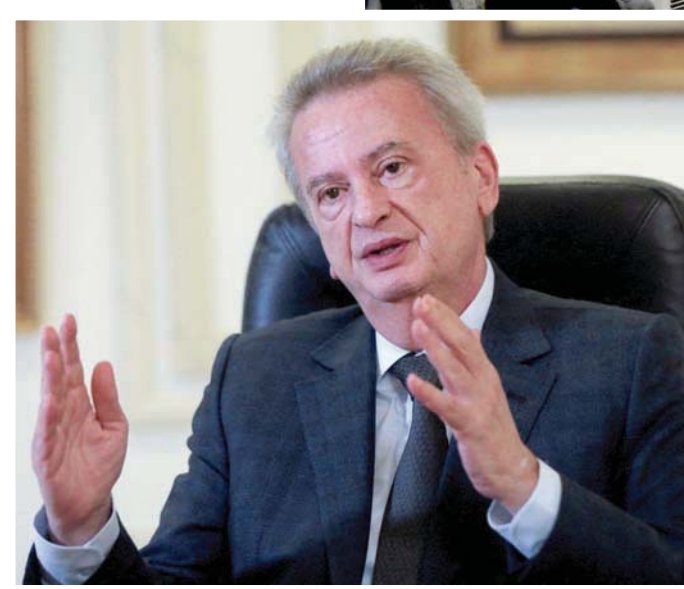
حاكم مصرف لبنان، رياض سلامة

البناني سبتعامل معها وفق ما يقتضيه القانون اللبناني والسيادة الوطنية». ورأى وزير العدل الأسبق المحامي إبراهيم نجار، أن «مفاعيل مذكرة التوقيف التي أصدرتها القاضية بوريزي محصورة ضمن الحدود الفرنسية، وليس لها أي وقع قانوني في لبنان». وقال لـ«الشرق الأوسط»، إن «القضاء اللبناني لا يستطيع أن يحقق بجرائم وقعت في فرنسا، إلا إذا صدر حكم فرنسي نهائي، وحصل تنسيق مع القضاء اللبناني، وبعد إحالة الملف إلى لبنان، حينها تطبق المعاهدات والاتفاقيات الدولية»، لافتاً إلى أن نسخة من مذكرة التوقيف الفرنسية ليحدد موقفه منها، وأشار مصدر سياسي ومالي ومعنوي في لبنان، لكن عندما ينتقل الملف من فرنسا إلى لبنان، يصبح القضاء اللبناني صاحب الصلاحية المطلقة».