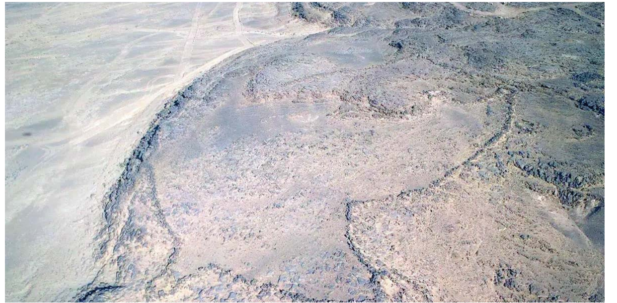
المسح يكشف عن لقي وآثار تنتمي إلى حقبة زمنية قديمة

الصحراوية تتباعد عن بعضها بمسافة 3,50 كم، كما اكتشفت في هذه المنطقة لوحة مُصَغَّرَة لمصيدة حجرية صحراوية مرسومة على حجر يبلغ طوله 382 سنتيمتراً، وعرضه 235 سنتيمتراً، ويعود تاريخها إلى نحو 8000 عام قبل الوقت الحالي، وقد عُثِرَ سابقاً على منشآت مُصَغَّرَة أخرى لهذه المباني الضخمة، لكنها لم تكن بالدقة الكبيرة نفسها التي نُقِدَت بها منشآت الظلمات.