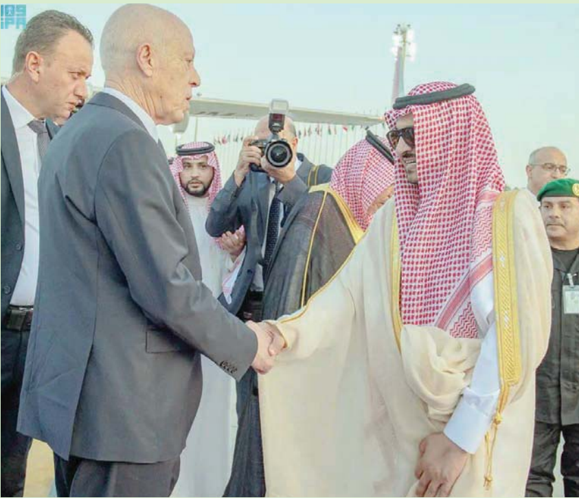
جانب من وصول الرئيس التونسي إلى جدة أمس