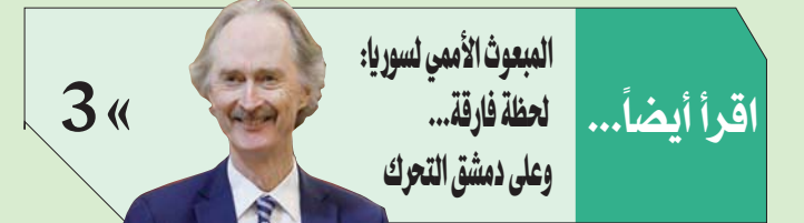
المبعوث الأممي لسوريا: لحظة فارقة... وعلى دمشق التحرك