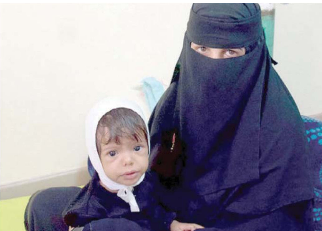
طفلة يمنية تتلقى الرعاية بـمكتب تابع لمنظمة الصحة العالمية (الأمم المتحدة)

وسبق للجماعة الانقلابية أن أصدرت في مطلع 2021 تعليمات إلى عدد من المستشفيات والمراكز