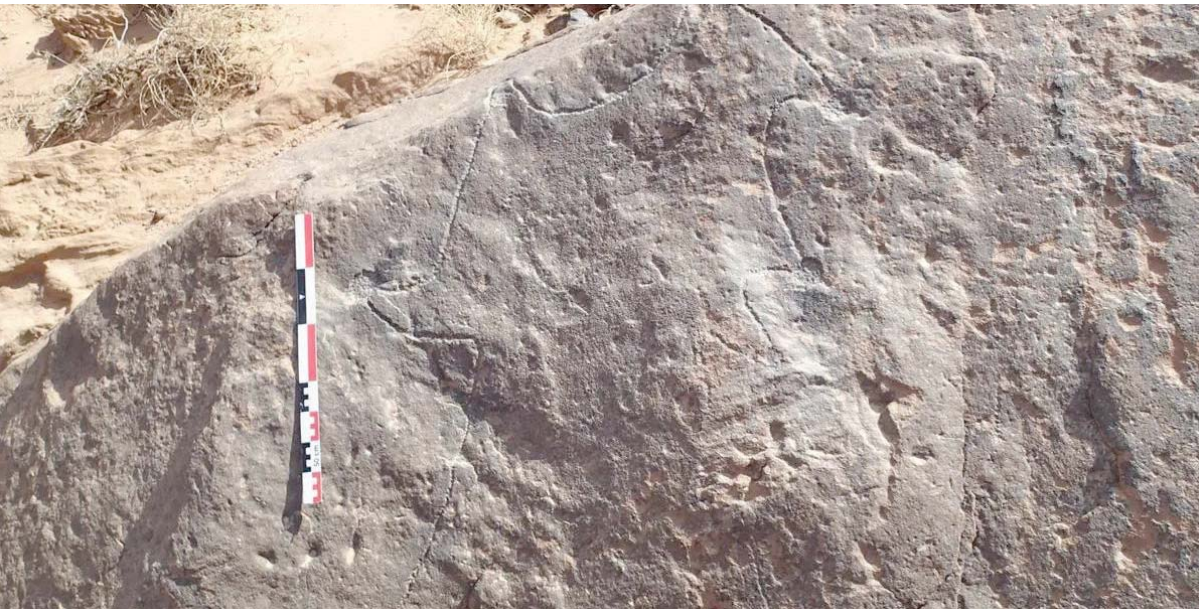
مسح أثري يكشف منشآت حجرية تعود إلى القرن التاسع قبل الميلاد

وفي ورقة علمية نشرتها مجلة «يلوس ون» عن المنشآت الحجرية التي تُمثّل مصائد من الحجر، ومباني ضخمة الحجم تُستخدم مصائد للحيوانات أُخِذت لفترة ما قبل التاريخ، وتعكس قدرة