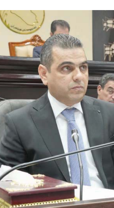
النائب الأول لرئيس لجنة العمل في البرلمان العراقي حسين عرب

وأضاف: «هناك جملة من القوانين المدرجة الآن في لجنة العمل البرلمانية سوف يتم تشريعها تخصص الخنطيمات التقنافية والاتحادات والنقابات، حيث ستكون مقترحات قوانين من البرلمان بهذا الشأن». وأكد عرب أن «هذا القانون يتميز عن القوانين السابقة بتضمنه مواد عن التأمين الصحي والسكن الأعلى للتقاعد والسن الأبدني والخدمة القليلة، وبالتالي يترك للعامل تحديد وضعه وفقاً للقانون، حيث أخذنا على محمل الجد القوانين التي تم تشريعها بهذا الشأن في العديد من دول الجوار والعالم».