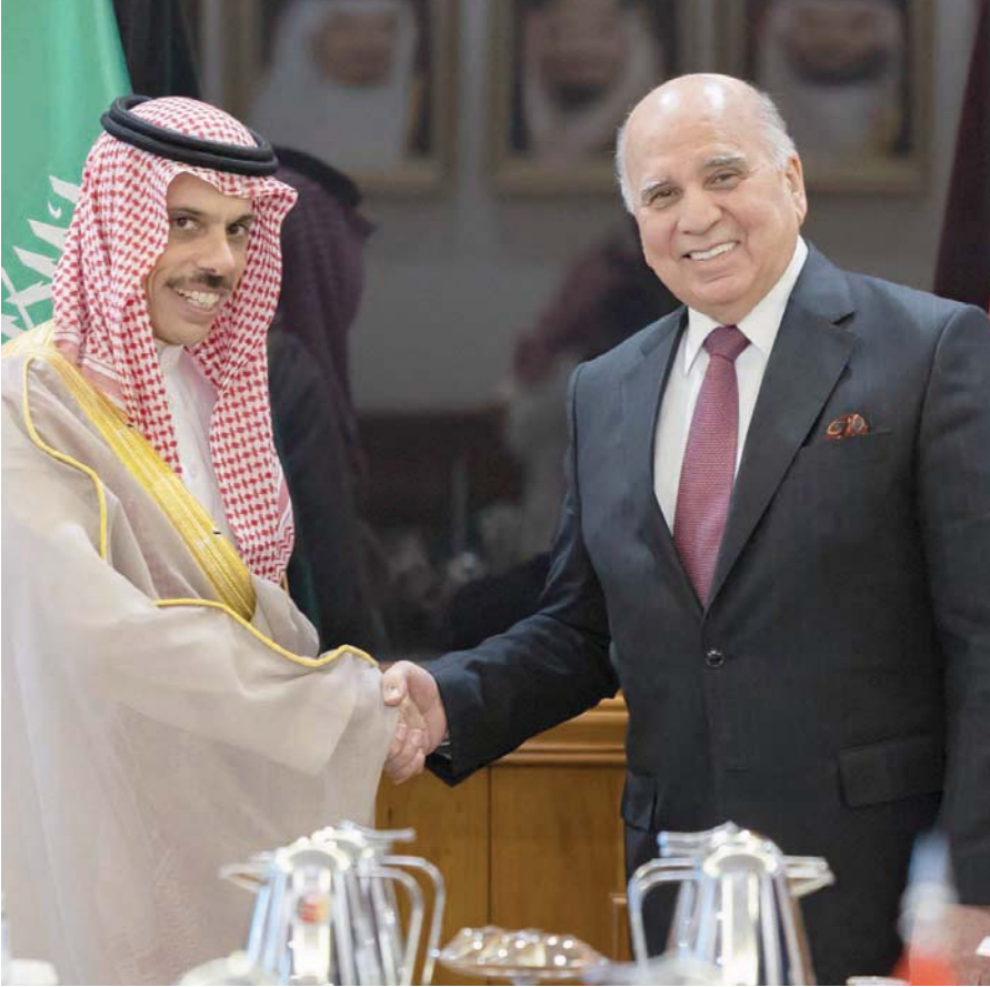
وزير الخارجية السعودي ونظيره العراقي بعد اجتماع اللجنة المشتركة لمجلس التنسيق