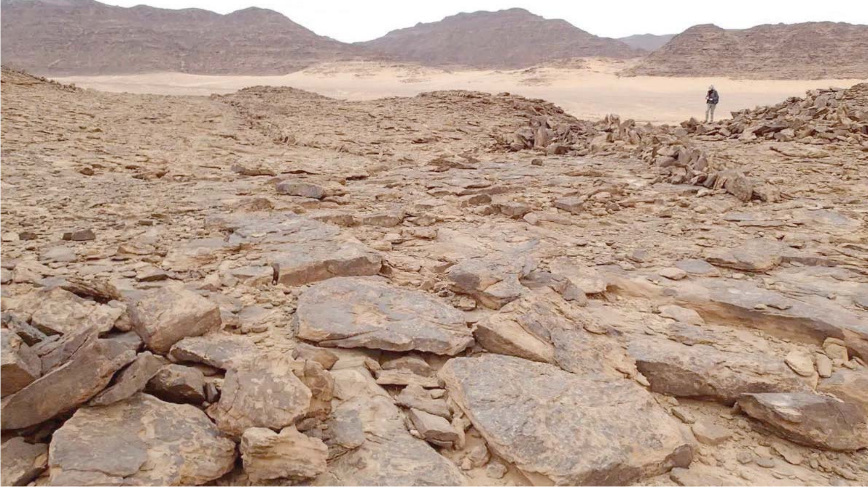
شوهدت هذه المصائد الحجرية لأول مرة، واعتبرت مجرد مبان أثرية متطورة (واس)

ونشر باحثون من المركز الوطني للبحث العلمي وباحثون من معاهد مختلفة لوجحتين مرسومتين، تمثلان مخططات مُصَغَّرَة لمصائد حجرية في السعودية والمناطق المجاورة لها، وقد عُثِرَ في جبل الظلمات في منطقة الجوف على زوجين من المصائد الحجرية