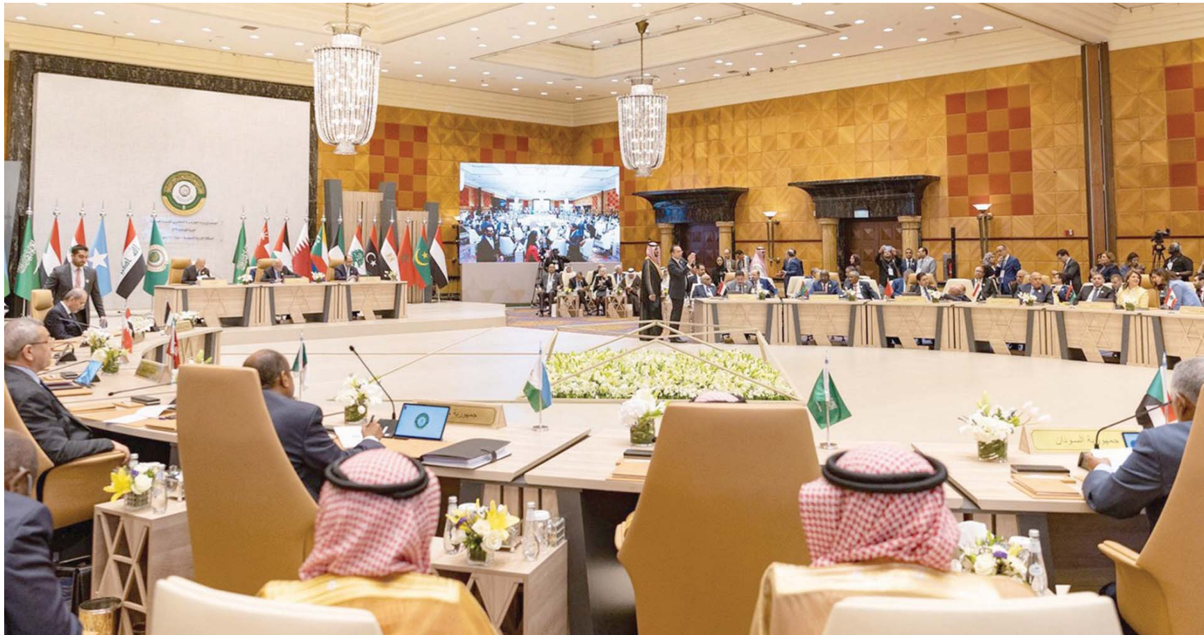
جانبا من اجتماع وزراء الخارجية العرب في جدة الأربعاء

● في بداية 2014 عقد مؤتمر في سويسرا لتطبيق «بيان جنيف»، وفي نهاية 2015 عقد مؤتمر في فيينا أسفر عن صدور القرار 2254 من مجلس الأمن. في 2023، هل سنرى مؤتمراً دولياً، بحضورك، للبحث عن حل سياسي سوري؟ - من المبكر التنبؤ بما سيكون عليه الحال. ما أريد قوله، إنه كي نتحرك إلى الأمام، لا بد من أن نعمل جميع هذه المبادرات معاً. أريد العمل على أن تكون جميع الأطراف على الطاولة: الأطراف السورية، دول مسار استئناس، الأطراف العربية، والولايات المتحدة والدول الأوروبية. وسأبدل قصارى جهدي لتحقيق ذلك.