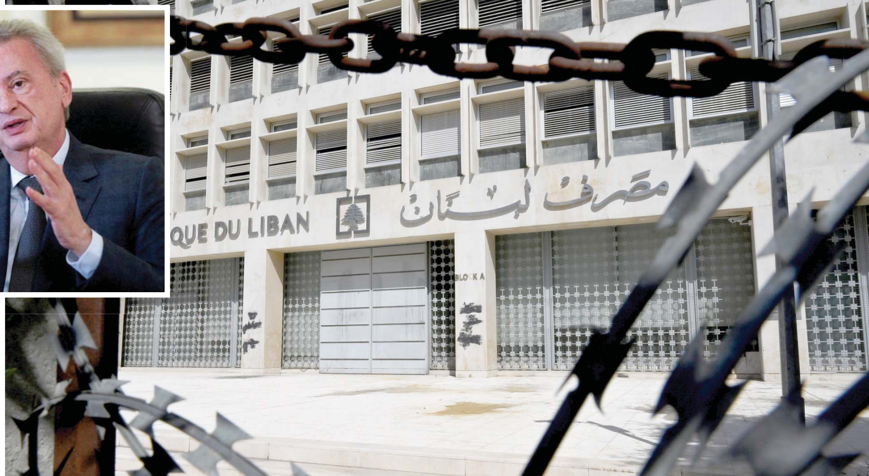
المقر الرئيسي لمصرف لبنان، في بيروت