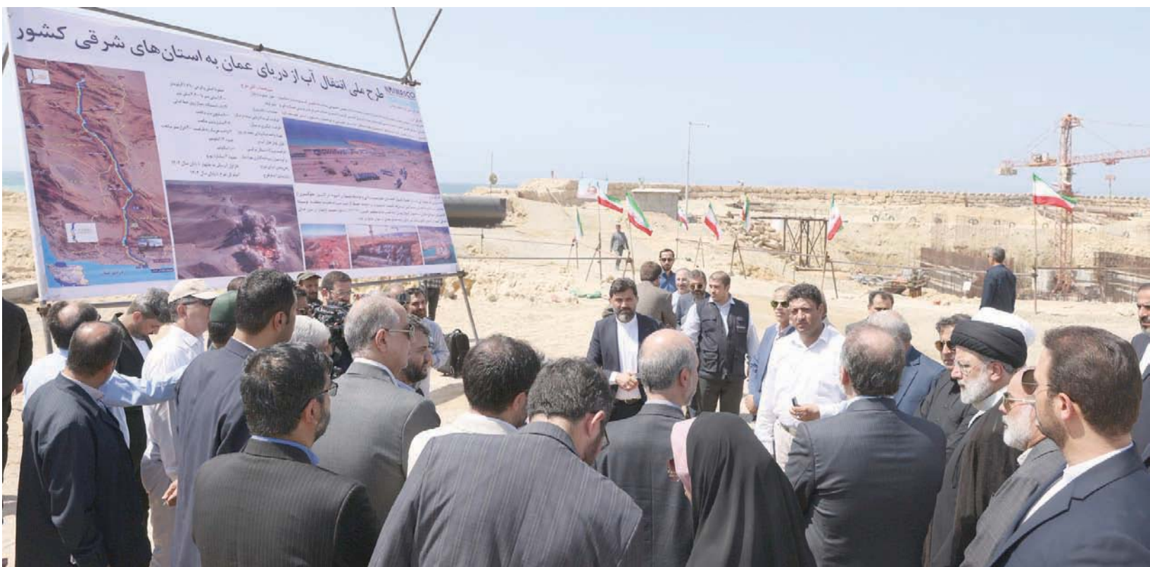
رئيسي يفتتح خط أنابيب نقل المياه من خليج عمان إلى محافظة خراسان وبلوشستان (الرئاسة الإيرانية)