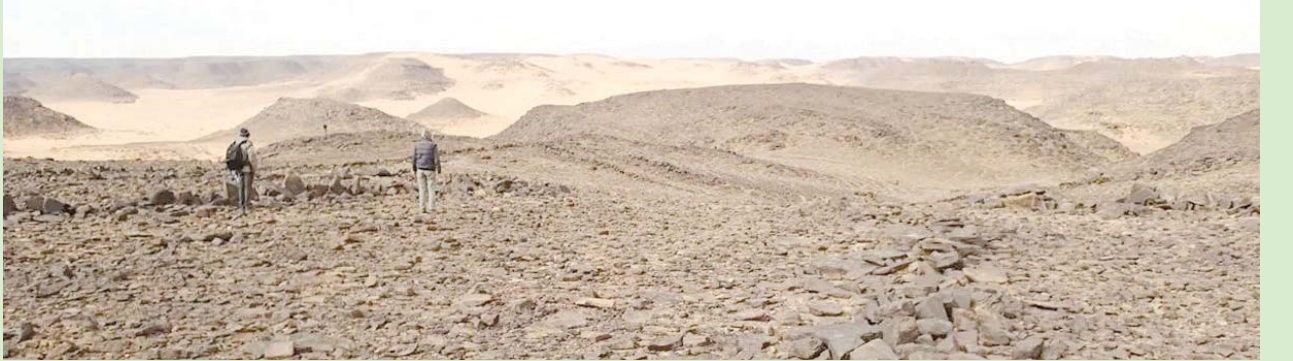
منطقة الجوف معين لا ينضب من الاكتشافات التاريخية