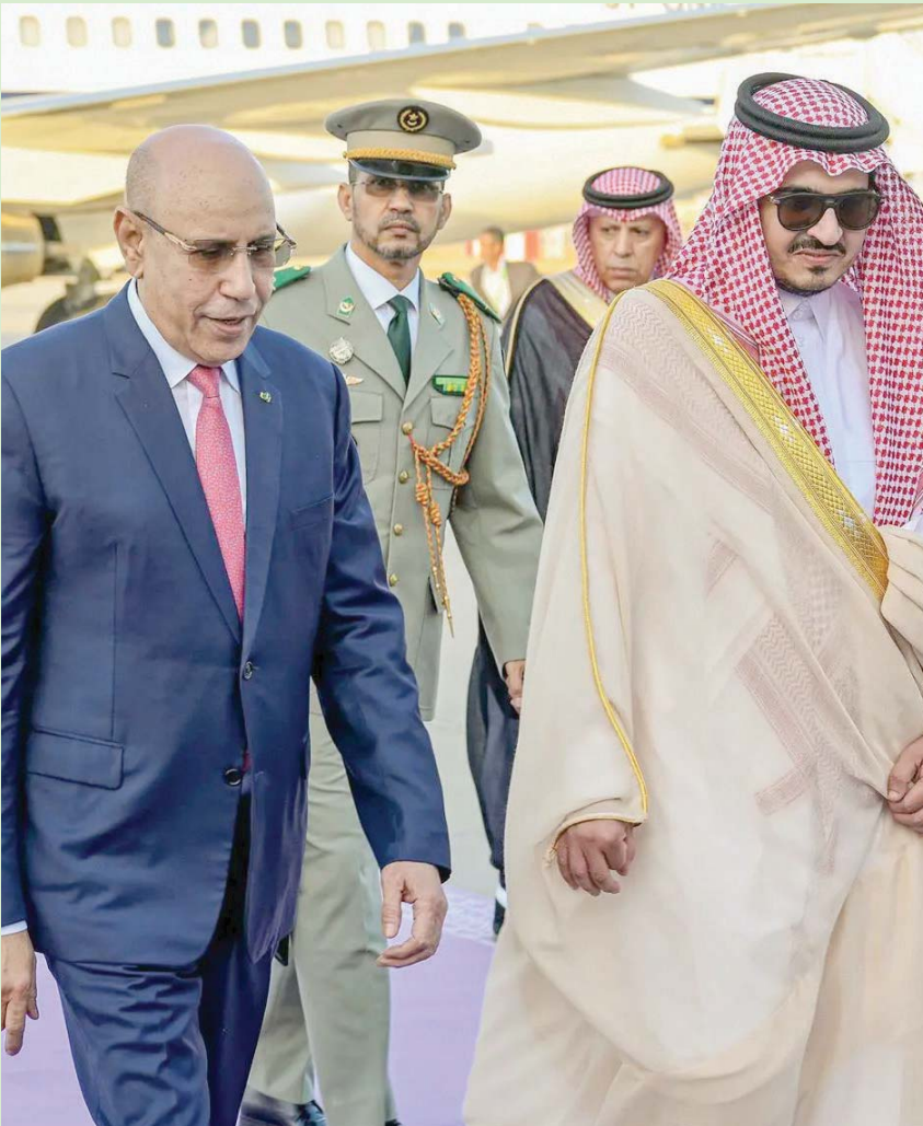
رئيس موريتانيا لدى وصوله إلى جدة أمس

خليفة أهمية انعقاد قمة جدة العربية، في ظل الوضع الراهن وما تشهده المنطقة من تغيرات، وقال: «تعتقد هذا العام في مدينة جدة، والمناخ الإقليمي بسببه كثير من الأمل لتحقيق تطورات الشعوب العربية في الأمن والاستقرار والرفاه».