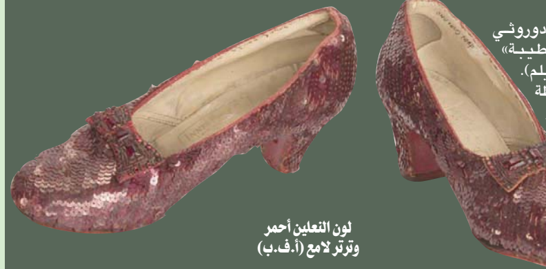
لون النعلين أحمر وتوتّر لامع

في الفيلم قد أُهديت إلى دوروثي من «غليندا الساحرة الطيبة» (الشخصية الخيالية في الفيلم). وقد صنعت النعال بواسطة غيلبرت ادريان كبير مصممي شركة «مترو غولدوين مايسر»، الذي صيغ زوجاً من النعال باللون الأحمر وغطاها بالترتر اللامع.