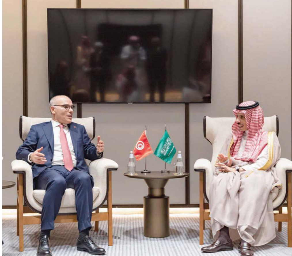
فيصل بن فرحان خلال لقائه وزير خارجية تونس في جدة