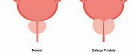
البروستاتا الطبيعية (الي اليسار) والمتضخمة

5- هذه الأعراض لتضخم البروستاتا الحميد، غالباً ما تتفاقم ببطء، لكن أحياناً تظل كما هي، أو حتى تتحسن مع مرور الوقت. ولكن تجدر ملاحظة أن كثير حجم التضخم في البروستاتا لا يحدد دائماً مدى شدة الأعراض. فقد تظهر لدى بعض الأشخاص المصابين