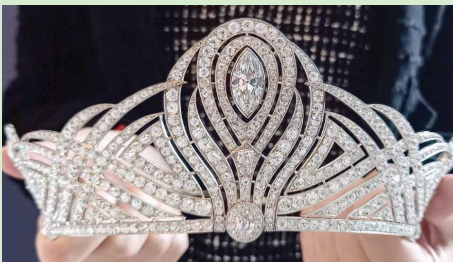
تاج «بييسورو» الماسي في دار «كريستيز» للمزادات

المزاد إنّ التاج «يشكل قطعة فنية مجوهرات «كريستيز» نحو 41,2 مليون فرنك سويسري (8,45 مليون دولار لكل منها. ونظّمت دار «سونديبن» وبلغت قيمة إجمالي مبيع مليون دولار) في أسبوع، بينما