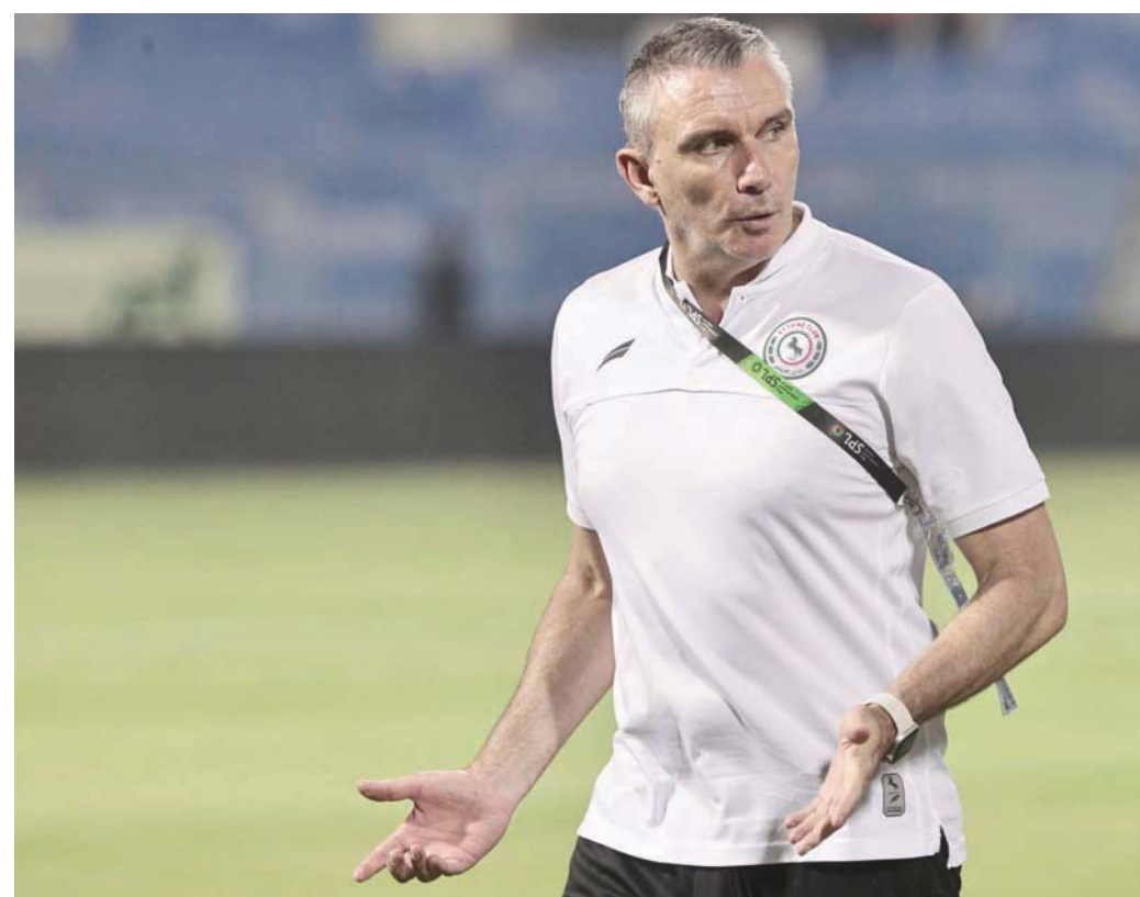
باتريس كارتيرون

وبعدما ظل الفريق من دون أي انتصار، وبفارق نقطي كبير عن أقرب منافسيه الباحثين عن الهروب من شبح الهبوط. وقرر نادي الاتفاق مع نهاية الجولة الثامنة عشرة فُض ارتباطه بالفرنسي باتريس كارتيرون، بعد سلسلة من النتائج السلبية للفريق، وبحسباً من إدارة النادي عن تفادي خطر الدخول في حسابات معقدة للهروب من شبح الهبوط. وودع الكرواتي كريشمير ريزتتش، مدرب فريق ضمك، منصبه مع الجولة التاسعة عشرة في نهاية غير متوقعة للمدرب الذي وضع بصمة كبيرة مع الفريق، وأظهره بأفضل مستوياته في الموسم الماضي، إلا أن استمرار النتائج السلبية ساهم برحيل المدرب كريشمير. وبعد هدوء خيم قليلاً على الأجواء في الدوري، وساد الاستقرار نسبياً، أعلن النصر إقالة الفرنسي رودري غارسيا في واحد من أكثر القرارات إشارة للجدل، خاصة أن غارسيا كان يقود فريقه للمنافسة بشراكة على لقب الدوري، في ظل فارق نقطي بينه وبين المتصدر «الاتحاد»، حينها كان الفارق