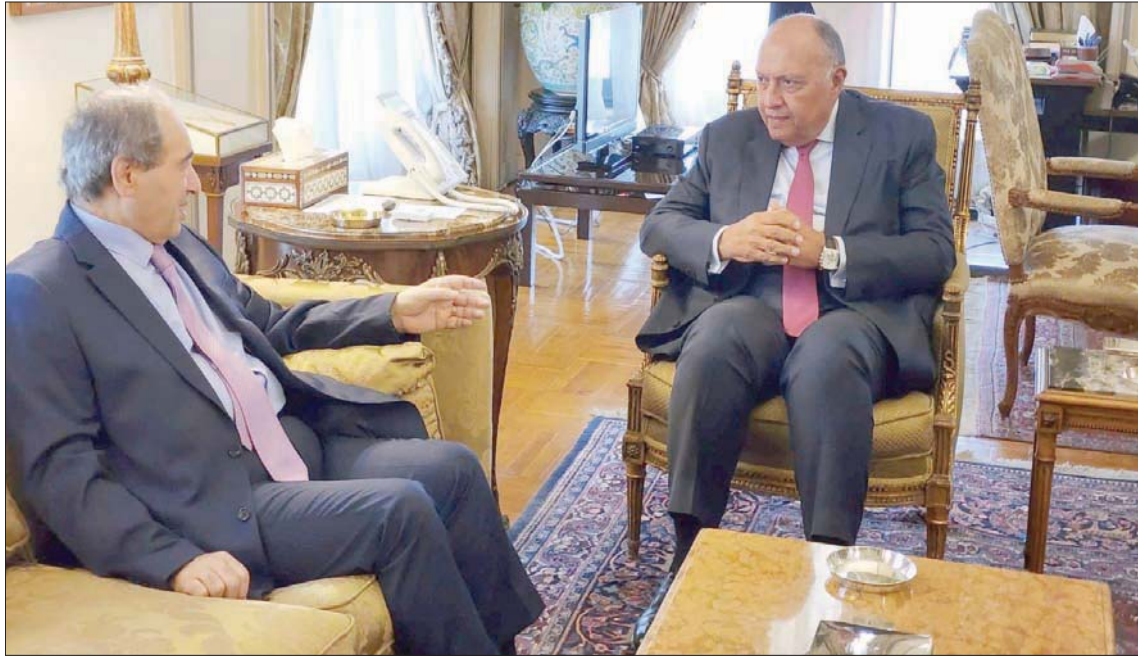
سامح شكري وفصل المقداد خلال اجتماع ثنائي في القاهرة

الأمير الذي سيعزز من عناصر الاستقرار والتنمية في الوطن العربي والمنطقة، من جانبه، أعرب وزير