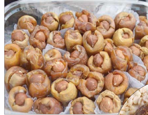
تمر محشو بالمكسرات