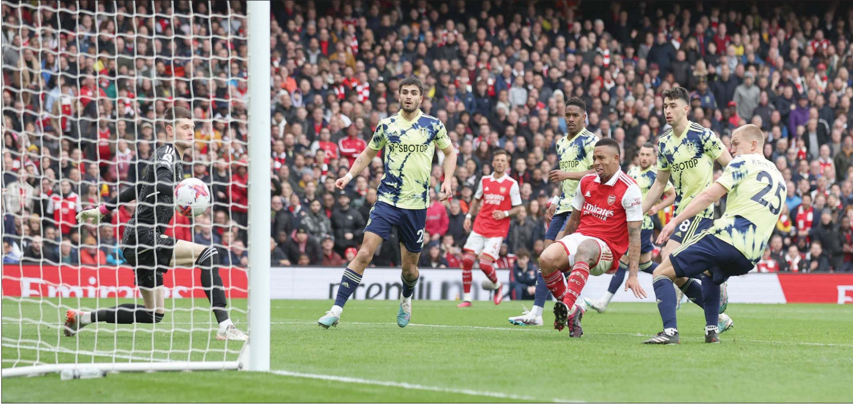
جيزوس يضيف الهدف الثالث لأرسنال في شباك ليدز

والهدف هو الأول لجيزوس منذ عودته قبل فترة وجيزة من الإصابة التي أبعدته عن كأس العالم مع البرازيل، وسجله منذ آخر هدف صحيح في مرمى توتنهام في الأول من أكتوبر تشرين الأول الماضي. وفي الشوط الثاني أجهز أصحاب الأرض على الضيوف، حيث أضاف المدافع بن وايت الهدف الثاني من مسافة قريبة مستغلاً تمريرة عرضية من البرازيلي غابريال مارتينيلي في الدقيقة 47، قبل أن يضيف جيزوس الهدف الثالث بعد مجهود فريدي من المهاجم