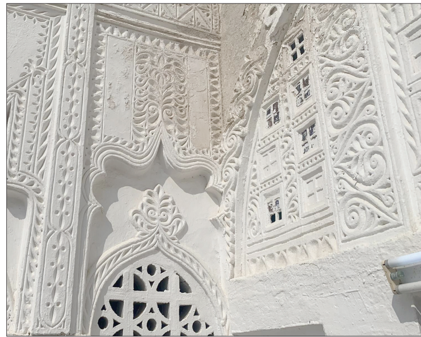
يمتاز المسجد بالزخرفات والنقوش على الجدران