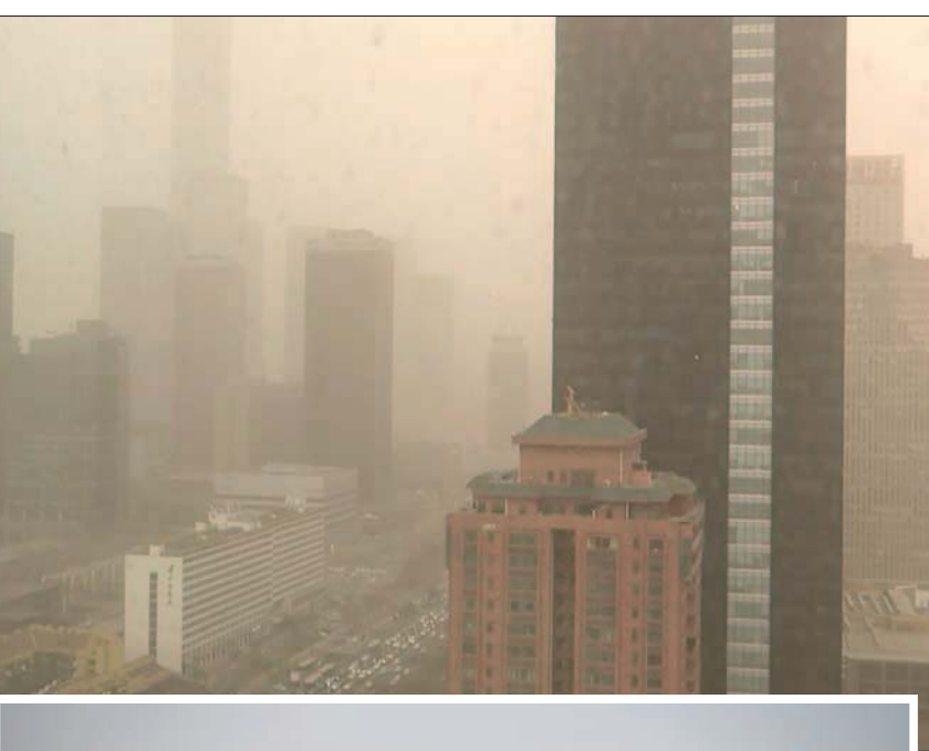
ضباب ناجم عن دخان المركبات والمواد الخاصة يغطي أفق بيروت في أكتوبر 2019

معاييرها الخاصة بجودة الهواء، تمثل التعديلات الجديدة حافزاً للتحرك من أجل مواكبة التوجه العالمي، وعلى سبيل المثال، أعلنت «وكالة حماية البيئة الأميركية»، في فبراير (شباط) 2023، عن مقترح لتعزيز المعايير الوطنية لجودة الهواء المحيط، من خلال خفض معيار الحد الأعلى لتركيز الجسيمات العالقة من 12 إلى ما بين 10 و9 ميكروغرامات في المتر المكعب سنوياً.