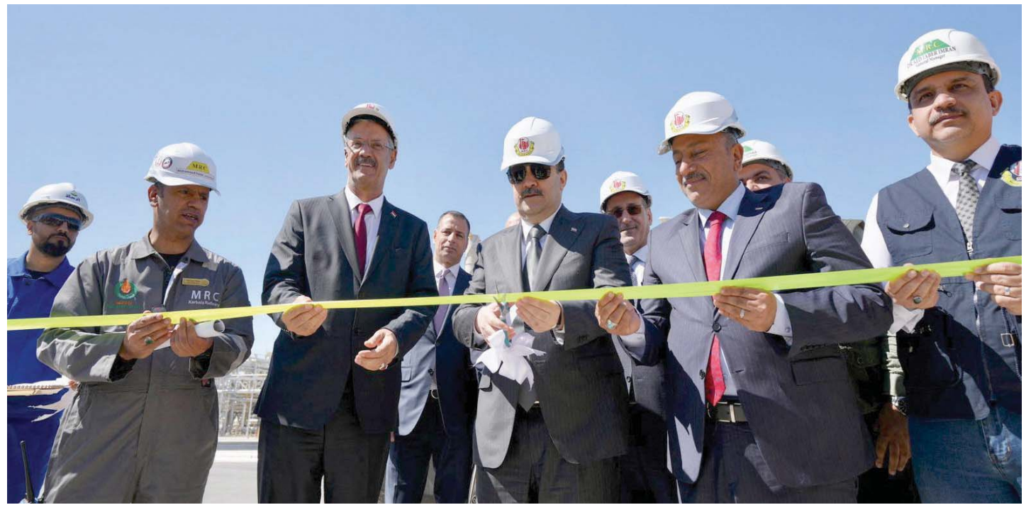
رئيس الوزراء العراقي محمد السوداني (وسط) خلال حفل إطلاق مصفاة نفط كركلاء (آ.ب.)

برميل يومياً من صادرات حقول كركلاء الشمالية، بعد أن فازت البلاد بقضية تحكيم طويلة الأمد ضد تركيا. ففي شكوى تعود إلى عام 2014، أكدت بغداد أن تركيا انتهكت اتفاقاً مشتركاً بالسماح لحكومة إقليم كردستان بتصدير النفط عبر خط أنابيب إلى ميناء جيهان التركي. وأصدرت هيئة التحكيم في باريس التابعة لغرفة التجارة الدولية، يوم 23 مارس 2023 الحكم النهائي لصالح العراق في دعوى التحكيم المرفوعة من قبل جمهورية العراق ضد الجمهورية التركية، لمخالفاتها أحكام «اتفاقية خط الأنابيب العراقية التركية» الموقعة في عام 1973.