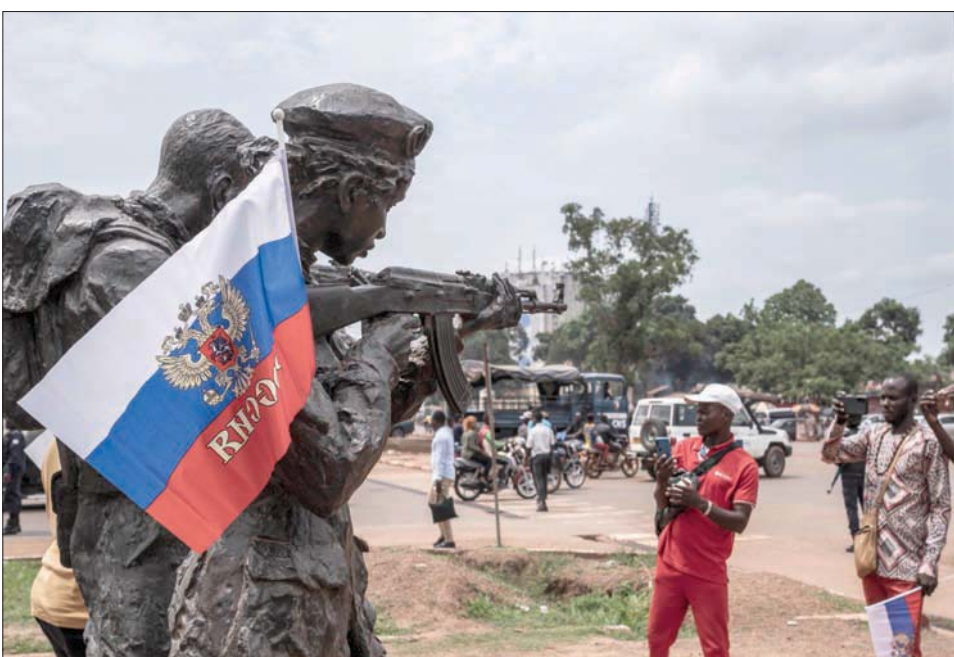
علم روسي معلق على تمثال في عاصمة جمهورية أفريقيا الوسطى 22 مارس

وتعهدت الحكومة الروسية، في الوثيقة الاستراتيجية، بأنها ستعطي الأولوية الضمان سيادة واستقلال الدول الأفريقية، من خلال المساعدة في «مجالات الأمن، بما يشمل أمن الغذاء والطاقة والتعاون العسكري وكذلك الفني». ووفقاً للسياسة الروسية الجديدة تجاه أفريقيا، لتلزم موسكو بـ«المساعدة في حل والتغلب على تداعيات النزاعات المسلحة في أنحاء أفريقيا جميعها على أساس المبدأ الذي صاغه الاتحاد الأفريقي (المشاكل