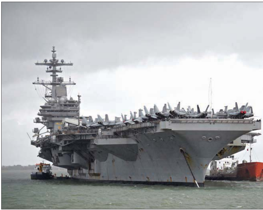
تمديد مهمة حاملة الطائرات «جورج إتش دبليو بوش» في حال تطلب الأمر تدخلها في سوريا

محليين يقودهم الأكراد فلول تنظيم «داعش».