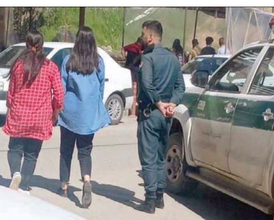
إيرانياتان من دون حجاب أثناء مرورهما أمام شرطي الأسبوع الماضي (شبكات التواصل)

بنتفيذ خطة طرحها البرلمان الإيراني، وتشمل غرامات مالية غير مسبوقه. وقال النائب المتشدد حسين جلالی، إن السلطات ستعزف أن «المجلس الأعلى للثورة الثقافية» و«المجلس الأعلى للأمن القومي» صادقا على خطة جديدة لضبط الحجاب، مشيراً إلى أنها عرضت على مكتب المرشد الإيراني والجهاز القضائي، ومن المقرر أن تقدمها الحكومة لكي يصادق عليها البرلمان وتدخل حيز التنفيذ.