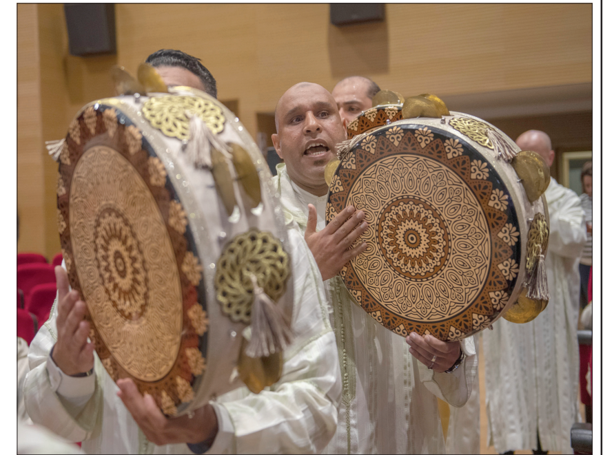
موسيقيون يقدمون فقرة غنائية ضمن مهرجان رمضانيات في الرباط بالمغرب