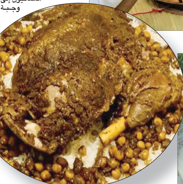
المشاوي من أهم الأطباق في المطبخ العماني

تقليدية شهيرة تسمى «معصور العوال»، وتتكون من نوع معين من أسماك القرش المجففة؛ حيث تتم