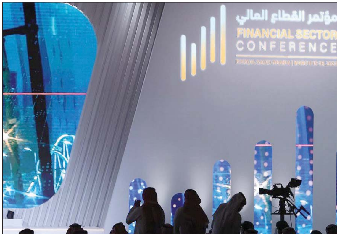
السعودية تدفع بتحول رقمي في جميع المجالات بينها قطاع الصناعة المالية بشتى أنشطتها

وبالإضافة إلى الارتفاع القياسي في شركات التقنية المالية المرخصة، وافق مجلس الوزراء السعودي على ترخيص ثلاثة بنوك رقمية محلية. أولها يتضمن تحويل شركة «إس تي سي باي» إلى بنك رقمي برأسمال يبلغ 2,5 مليار ريال (667 مليون دولار). ويتضمن ثاني بنك، شركة عبد الرحمن بن مسعود العراشد وأولاده، التي أسست البنك السعودي الرقمي برأسمال قدره 1,5 مليار ريال (400 مليون دولار). وتم ترخيص بنك «ال 360»، ليصبح ثالث بنك رقمي يزاوّل أعماله في السعودية. وانضم صندوق الاستثمارات العامة إلى المستثمرين الرئيسيين في دعم بنك «ال 360».