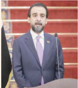
رئيس البرلمان العراقي محمد الحلبوسي

الخمس الماضي. وفيما تمثل هذه البادرة إشارة حسن نية حيال قيادات المكون السني التي سبق أن تم اتهامها بالإرهاب، ومن بينها العيساوي، ونائب رئيس الجمهورية الأسبق طارق الهاشمي، وشيخ عشاير الدليم علي حاتم السلیمان، فإنها من جانب آخر لا تبدو بادرة مريحة لقيادات سنية ترى في عودة بعض الوجوه القديمة إلى ساحة العمل السياسي من جديد خطراً عليها.