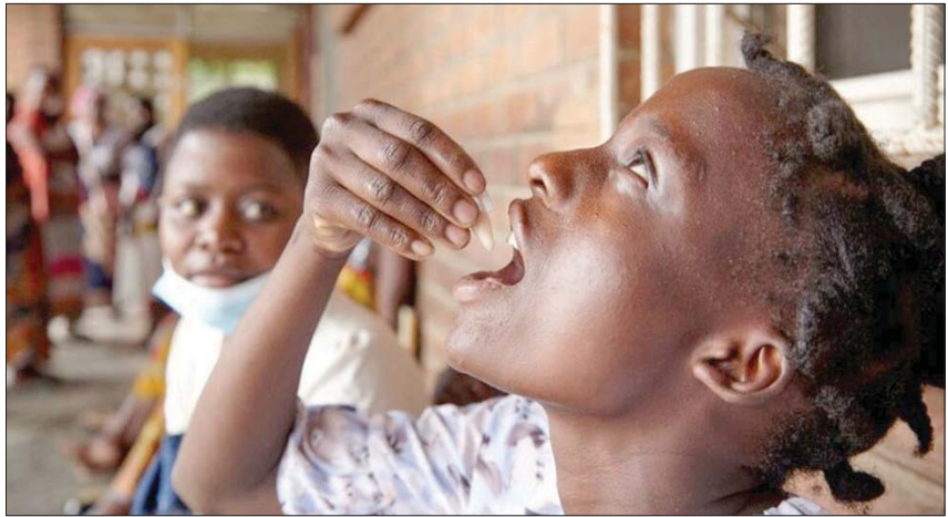
فتاة تتناول جرعة من لقاح الكوليرا

لواجهة تفشي الكوليرا، هو اللقاح، حيث تمنح جرعات من اللقاح في المناطق التي تشهد تفشي المرض، وهو ما فعلته منظمة الصحة العالمية في الشرب والصرف الصحي، والتدخل الصحي المتاح