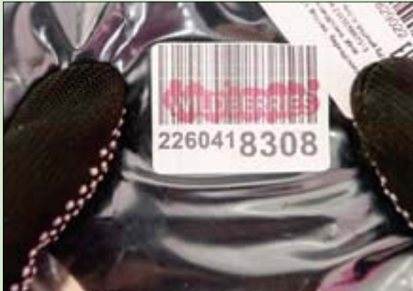
بدأ تطبيق الرمز الشريطي في الثالث من أبريل 1973

على السواء. ويومياً، تُمسح هذه الخطوط المستقيمة التي تختلف سماكتها بحسب المنتج، ستة مليارات مرة في العالم، بينما يمر 70 ألف منتج كل ثانية عبر صناديق الدفع. وتشير الشركة الفرنسية متوسطة الحجم «سيستيم أو» (رابع كبرى شركات التوزيع في فرنسا مع 11,6 في المائة من حصة السوق ونحو 1700 متجر)، إلى أنها سجلت 523 عملية بيع لمنتجات أخضعت لمسح رمزها الشريطي في عام 2022.