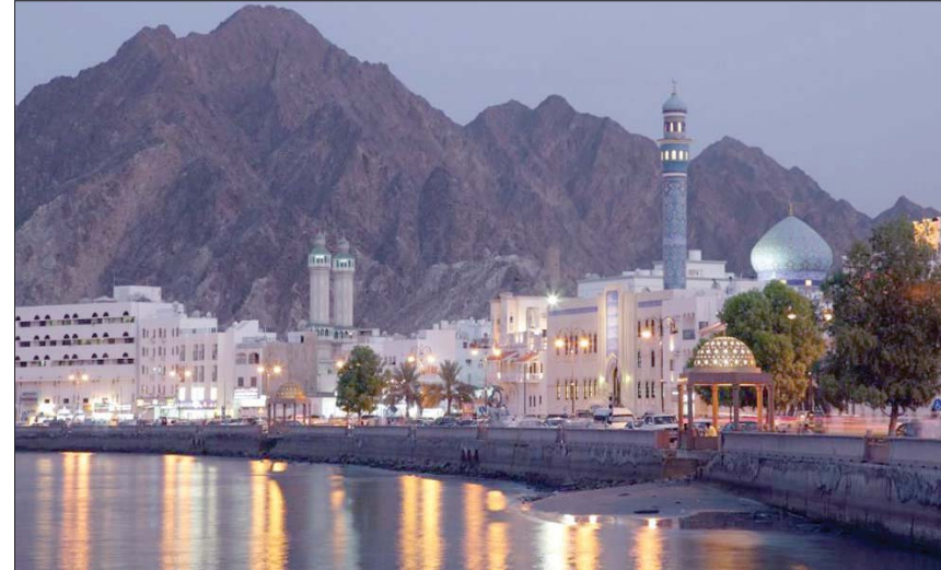
إحدى المدن الساحلية في عمان

وأضافت أن سلطنة عُمان عازمة على مواصلة تحسين مركزها المالي والاقتصادي؛ ما سيزيد من مرونتها في مواجهة تقلبات أسعار النفط. وتتوقع الوكالة أن ينخفض الدين العام إلى نحو 16,5 مليار ريال