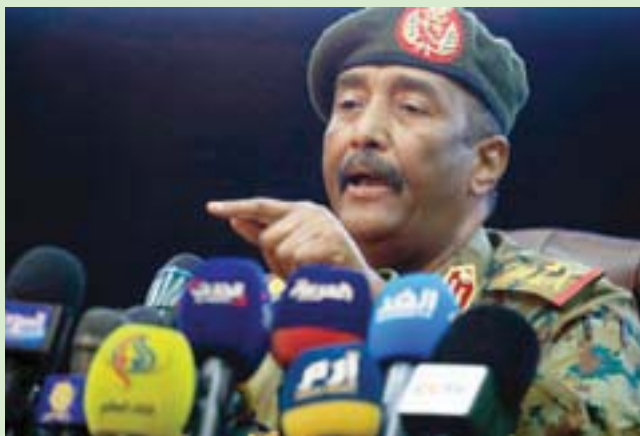
قائد الجيش الفريق البرهان

وحل مجلس السيادة، والغى بنوداً في الوثيقة الدستورية، وأعلن حالة الطوارئ في البلاد. وركزت المحادثات بين الموقعين على الاتفاق الإطاري في ديسمبر الماضي، بشكل أساسي، على تفكيك نظام الرئيس السابق عمر البشير الذي حكم 30 عاماً، استعان معدودة؛ تمهيداً لتوقيع الاتفاق الإطاري بين الجيش والقوات المسلحة والخدمة المدنية والقضاء.