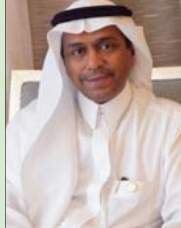
الدكتور عبد الفتاح مشاط نائب وزير الحج والعمرة

إثراء تجربتهم الدينية والثقافية، تحقيقاً لمستهدفات برامج «رؤية السعودية 2030».