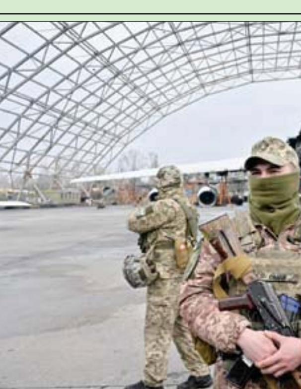
جنود يحرسون مراسم تسليم وحدات الجيش الأكراني المضادة للمسيرات عربات «بيك أب» مزودة برشاشات في مطار قرب كييف أمس... ويبدو حطام طائرة شحن من طراز «انتونوف» دمرها هجوم روسي