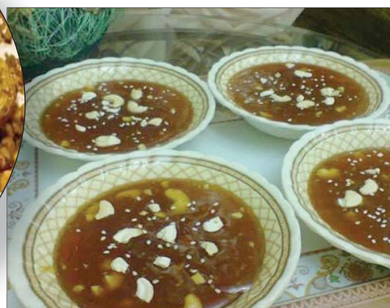
من أشهر أطباق الحلوى العمانية (الشرق الأوسط)