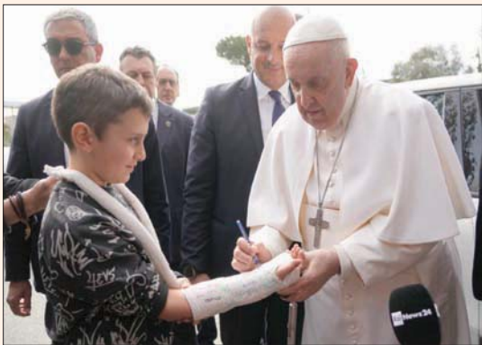
البابا يوقع على جيبيرة طفل بعد خروجه من المستشفى في روما أمس

حول احتمال إقدامه على الاستقالة أو التنحي عن منصبه، لا سيما أنه كان قد أعرب أخيراً عن استعداده للتخلي عن مهامه في حال شعر بأن حالته الصحية تحول دون ممارسته واجباته ومسؤولياته بالشكل المناسب.