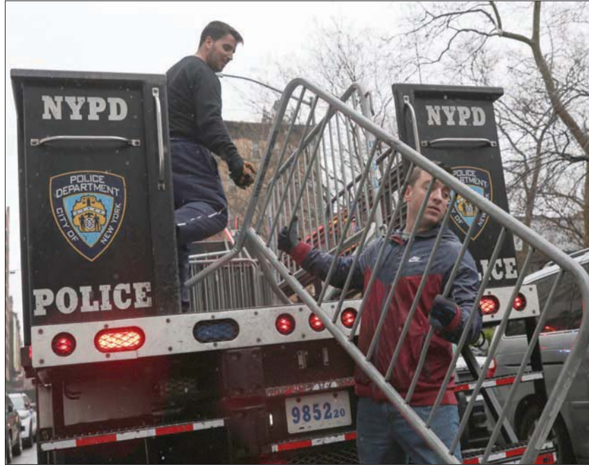
جانب من التعزيزات الأمنية خارج محكمة نيويورك أس

وأجرى فريق من عملاء الخدمة السرية المسؤول عن حماية الرؤساء الحاليين والسابقين يوم الجمعة، جولة في قاعة المحكمة وخارجها، لرسم خريطة دخول ترمب إلى المبنى، وفقاً لمسؤولي إنفاذ القانون. ويقل عن مسؤول مشارك في العملية، قوله، إن «عشرات العملاء» سيقيمون بتأمين سفر الرئيس السابق، من مارا لاغو، مقر إقامته في فلوريدا، إلى نيويورك. وقال المسؤول إن مديرية الخدمة السرية كمبرلي تشيبت، اطلعت نوابها على خطط يوم الثلاثاء، وأبلغتهم بأن الوكالة ستدقق «الخطوات اللازمة» لحماية ترمب، بما في