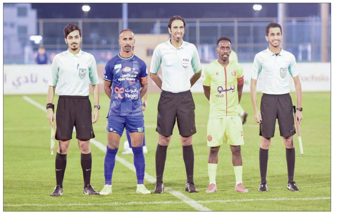
قائد الفتح مع طاقم الحكام خلال الودية الأخيرة أمام القادسية