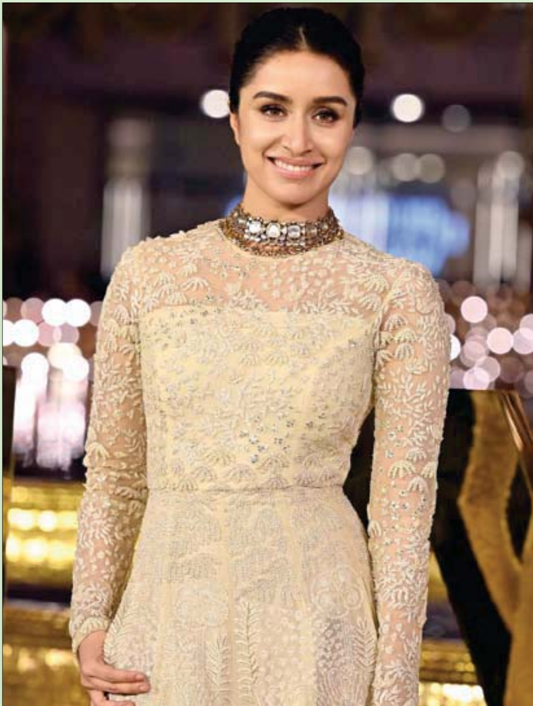
المثلة الهندية شرادا كابور لدى مشاركتها في افتتاح «مركز أمباني الثقافي» في مومباي

أكل المفاتيح والقعدان/ نتيجته ضغمت مع سكر