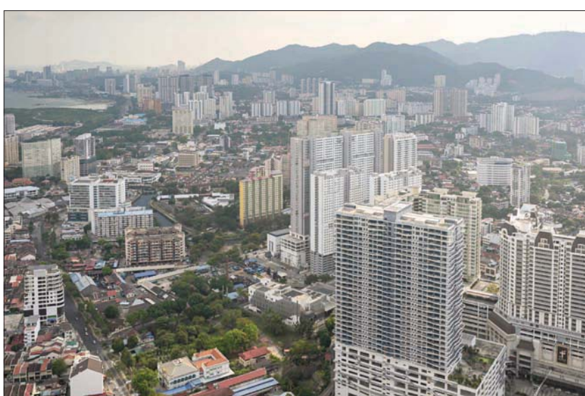
مبان سكنية وتجارية في مدينة جورج تاون بجزيرة بينانغ في ماليزيا

وتابع البيان بأنه تم إحراز تقدم في فصول الخدمات والاستثمارات الخاصة بالاتفاق وسيشمل قطاعاً جديداً لخدمات الانصاات، مشيراً إلى تطلع الحكومتين للتوقيع على البروتوكول الخاص بالمفاوضات اللاحقة للاتفاق. في أقرب وقت ممكن هذا العام. ووقعت حكومتا البلدين على مذكرة تفاهم حول سلامة الغذاء والمخاضون بشأن الاتفاقيات التجارية الدولية، في سياق مبادرة «الحزام والطريق».