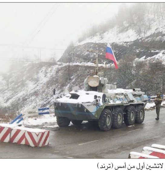
دبابة ومركبات روسية في معبر لاتشين أول من أمس

تشير إلى «المسار الإيراني». ولم يقدم تفاصيل. وقبل أن يتفاهم التوتر بين الجانبين، الأسبوع الماضي، كان نائب وزير الخارجية الإيراني محمد باقري كني قد زار برلين عاصمة أرمينيا، في 22 مارس (آذار) الماضي، وتعهدهم من هناك بأن تستخدم طهران «الإمكانات الكامنة لحل القضايا الإقليمية من خلال الحوار السلمي»، في إشارة إلى احتمال تجدد التوتر في إقليم ناغورني قره باغ المتنازع عليه بين أذربيجان وأرمينيا. وتزامنت زيارة باقري كني مع تهديدات وردت في وسائل إعلام «الحرس الثوري»، وتراوحت بين الحديث عن طلعات جوية، بما يشمل «طائرات الدرون»، وتاهب قواعد جوية، وكذلك الصواريخ الباليستية.