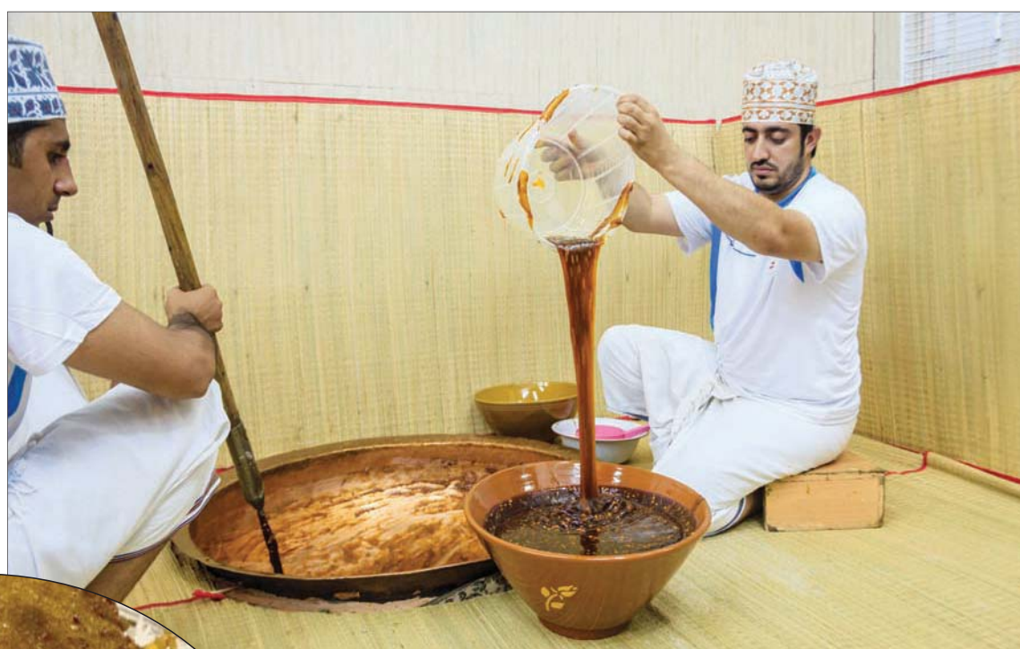
حلوى تقليدية الصنع (شارستوك)

لتلك الوليمة الفاخرة، كما أن الدخان والحرارة يجعلان اللحم طريا لدرجة لا توصف، كما يجعلان الرائحة طيبة للغاية.