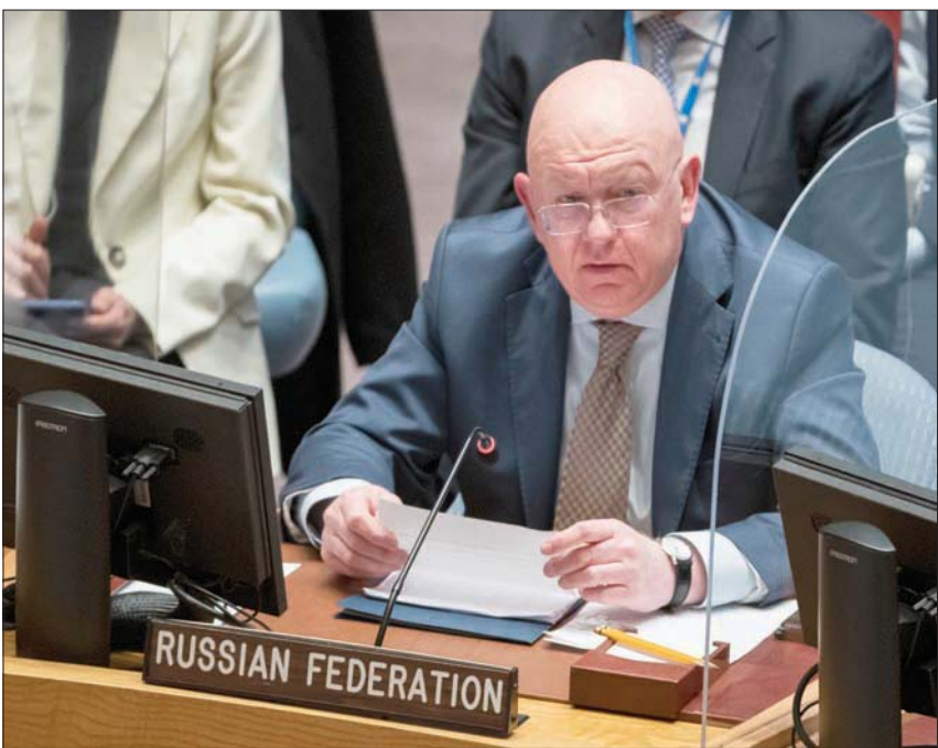
تتولى روسيا رئاسة مجلس الأمن الدورية ابتداءً من اليوم لمدة شهر خلفاً لموزمبيق والصورة لمنديوبا الدائم في المجلس

اسمه، إنه «إذا اتخذت الصين هذا القرار الكارثي، فسيكون له تأثير استراتيجي كبير على النزاع». وأضاف أن ماكرون يريد «إيجاد مساحة» مشتركة مع بكين للقيام بـ«مبادرات» من أجل «دعم السكان المدنيين الأوكرانيين، وكذلك أيضاً تحديد مسار متوسط المدى لحل النزاع». وتابع المستشار