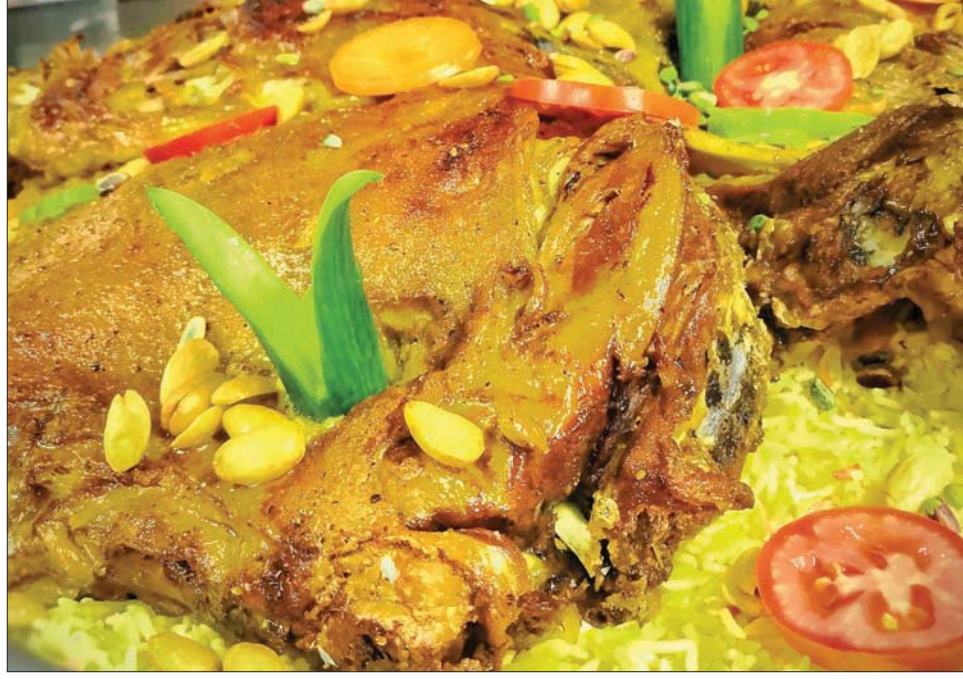
دمج التمر في أطباق مالحة