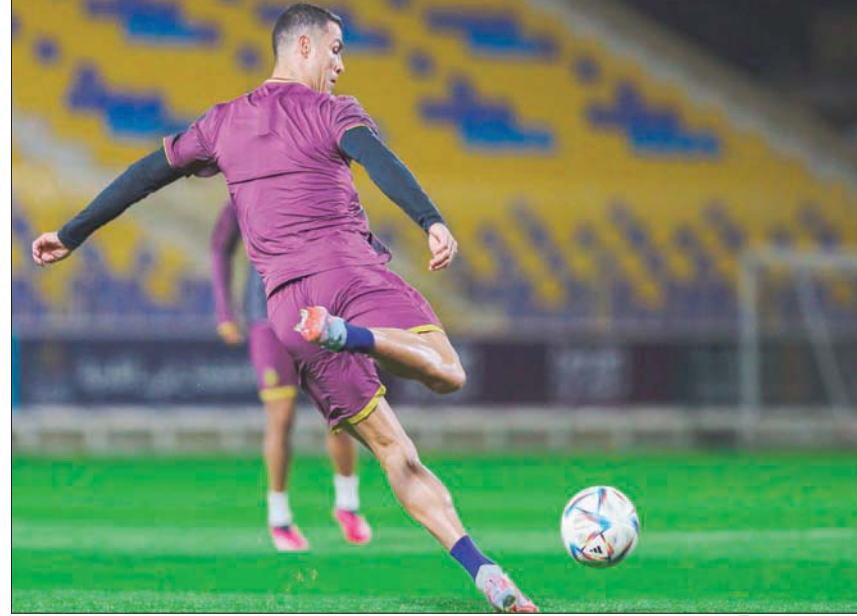
رونالدو عاد إلى النصر منتشياً بتألقه مع منتخب بلاده