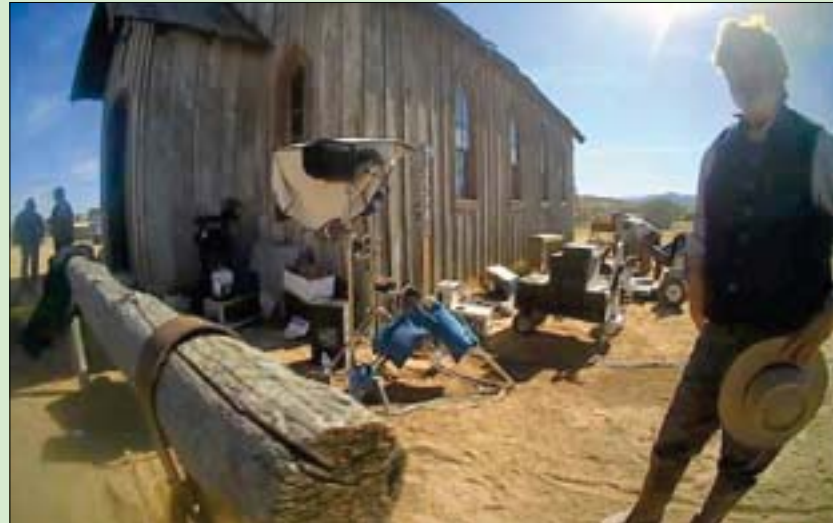
أليك بالدوين يتحدث مع المحققين في موقع تصوير الفيلم

كان ديف هولز (63 عاماً) قد أعطاه السلاح، وقال لبالدوين إنه «بارد»، أي أنه غير خطر بلغة هوليوود. وخلصت المدعية العامة كاري موريسي المولد أندرو تيت في الجمعة في محكمة بولاية نيو مكسيكو إلى أن ديف هولز، الذي تولى أيضاً دور المنسق الأمني لتصوير الفيلم ذي الميزانية المنخفضة، وبالتالي كان «خط الدفاع الأخير»، لم يفحص كل خرطوشة في السلاح للتأكد من أنها كانت غير مشحونة. ودأب اليك بالدوين (64 عاماً)، الذي اشتهر خصوصاً بمسلسل «30 روك»، على القول إن مسؤولي التصوير أكدوا له مراراً أن سلاحه غير خطر.