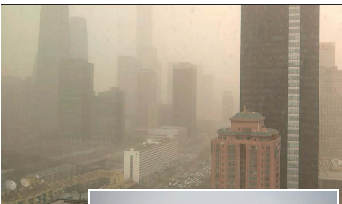
منظر للمنطقة التجارية المركزية في بكين خلال عاصفة ترابية في 10 مارس الماضي

إن تحسين نوعية الهواء في العالم العربي يتطلب مراجعة دقيقة للإطار التشريعي من أجل تعزيز متطلبات الصحة العامة وتحقيق أداء أفضل لمصادر التلوث. كما ينبغي الحزم في إجراءات مراقبة الملوثين عبر تطبيق القوانين بطريقة فاعلة، ووضع قوائم أولويات لتقييم المخاطر الصحية على أساس رصد الهواء، واعتماد خطوات إجرائية توازن بين تراكيز الملوثات والاستجابة للمخاطر الصحية.