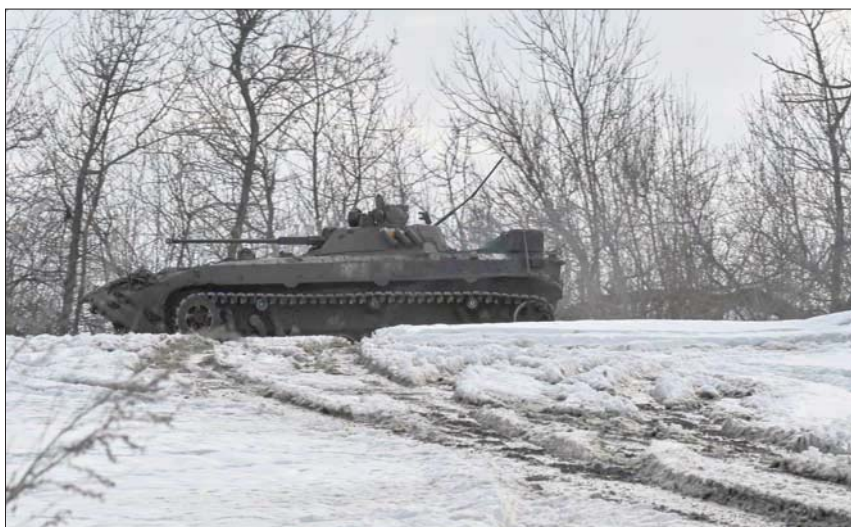
تساقط الثلوج بكثافة يعرقل تقدم القوات الروسية

بين وقائع أخرى، تعرضت مدينة زابورجيا وأماكن أخرى لهجوم بالصواريخ الباليستية. وقال جنرالات في كييف إن القوات البرية الروسية واصلت هجماتها بالقرب من أفدييفكا ومارينكا وباخوت في شرق البلاد. وفي سياق متصل وافعلت في الخدمة بوابة «آر بي كيه» الإخبارية أسس السبت بدء عملية التجنيد الروتينية الشتوية في روسيا، استناداً لمرسوم أصدره الرئيس الروسي فلاديمير. ووفقاً لما قاله ريدر أميرال، فلاديمير تسيمبلانسكي، من هيئة الأركان العامة، جرى استدعاء 147 ألفاً من 700 ألف جنود محتمل. ولكنه أكد أنه لا أحد منهم سوف يذهب للقتال في أوكرانيا.