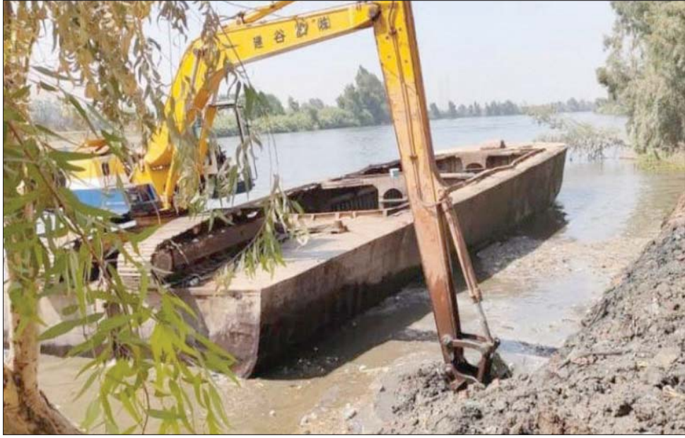
جهود إزالة التعديلات على مجرى نهر النيل

الإثيوبية، في بيان، بأن «مثل هذا التهديد يشكل خرقاً صارخاً لميثاق الأمم المتحدة، والقانون التأسيسي للاتحاد الأفريقي»، وطالبت مصر بـ«أن تكف عن تصريحاتها القاسية وغير القانونية»، وأنهت إثيوبيا، في يوليو (تموز) 2021 المرحلة الثانية من ملء الخزان، وفي أغسطس (آب) 2022 أنهت المرحلة الثالثة، في حين من المنتظر أن تنهي أديس أبابا المرحلة الرابعة من الملء بحلول الصيف. وينتظر إثيوبيا بالفعل توليد الكهرباء من «سد النهضة» في فبراير (شباط) 2022.