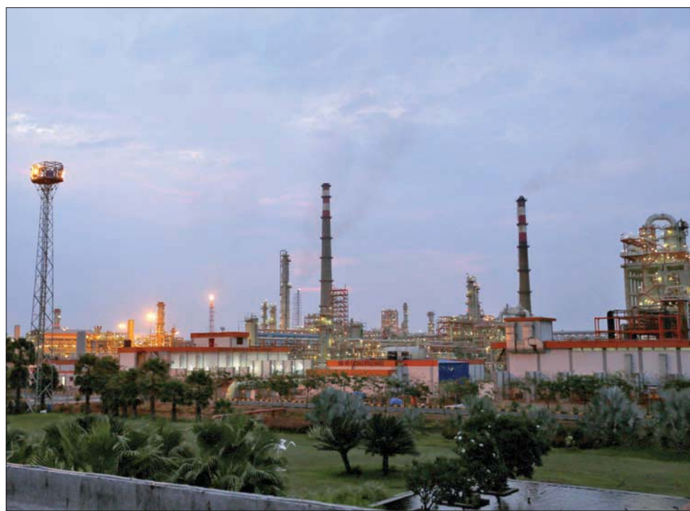
مصفاة لتكرير النفط في ولاية غوجارات الغربية بالهند

واعلنت مجموعة «روسنفط» العملاقة الروسية الأربعاء الماضي، عن اتفاق يهدف إلى تحقيق «زيادة هائلة» في إمداداتها لـ «مؤسسة النفط الهندية» العامة، إثر زيارة لرئيس مجلس إدارة المجموعة الروسية إيغور سبتنين للهند، ولم تحدد «روسنفط» قيمة العقد الموقع ولا الكميات المقررة في إطاره.