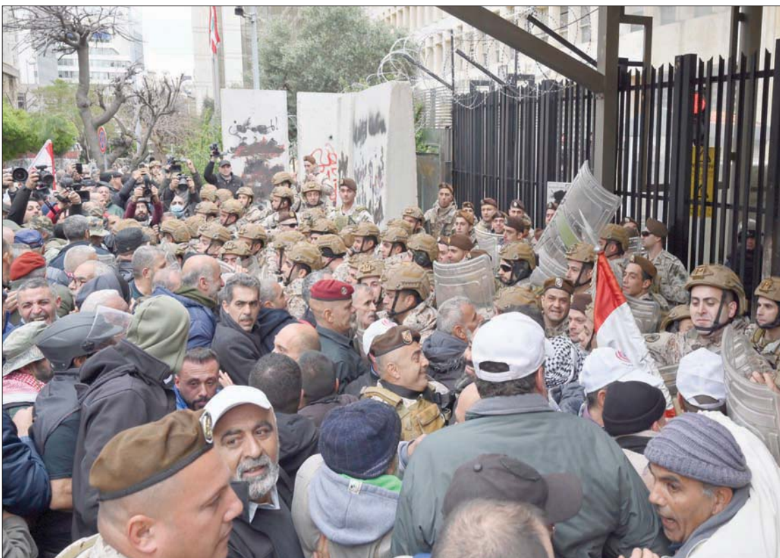
من مظاهرة العسكريين المتقاعدین أمام مقر «مصرف لبنان» في بيروت يوم الخميس للمطالبة بتسحين تعويضاتهم

أعلن المجلس التنفيذي لنقابة موظفي هيئة الاتصالات في لبنان (أوجيرو) تعليق لغاية الأسبوع المقبل، بانتظار انعقاد أول جلسة لمجلس الوزراء بعدما ارتفعت التحذيرات من عزل لبنان عن العالم نتيجة توقف عدد من السنترالات عن العمل، مع مرور أكثر من أسبوع على توقف الموظفين عن العمل. واتي ذلك في وقت يستمر فيه إضراب موظفي القطاع العام الذي لوّحت رابطة موظفيه بالتصعيد ما لم يتم تحقيق مطالبهم المتمثلة بتصحيح رواتبهم التي فقدت قيمتها مع الانهيار غير المسبوق لليرة اللبنانية.