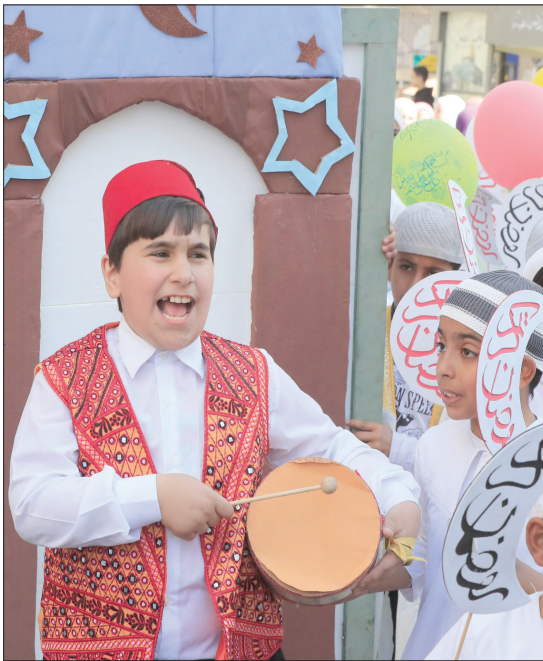
طفل لبناني يشارك في فعالية موسيقية بمناسبة رمضان في مدينة صيدا بلبنان