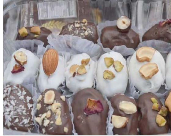
التمر المغطى بالشوكولاتة