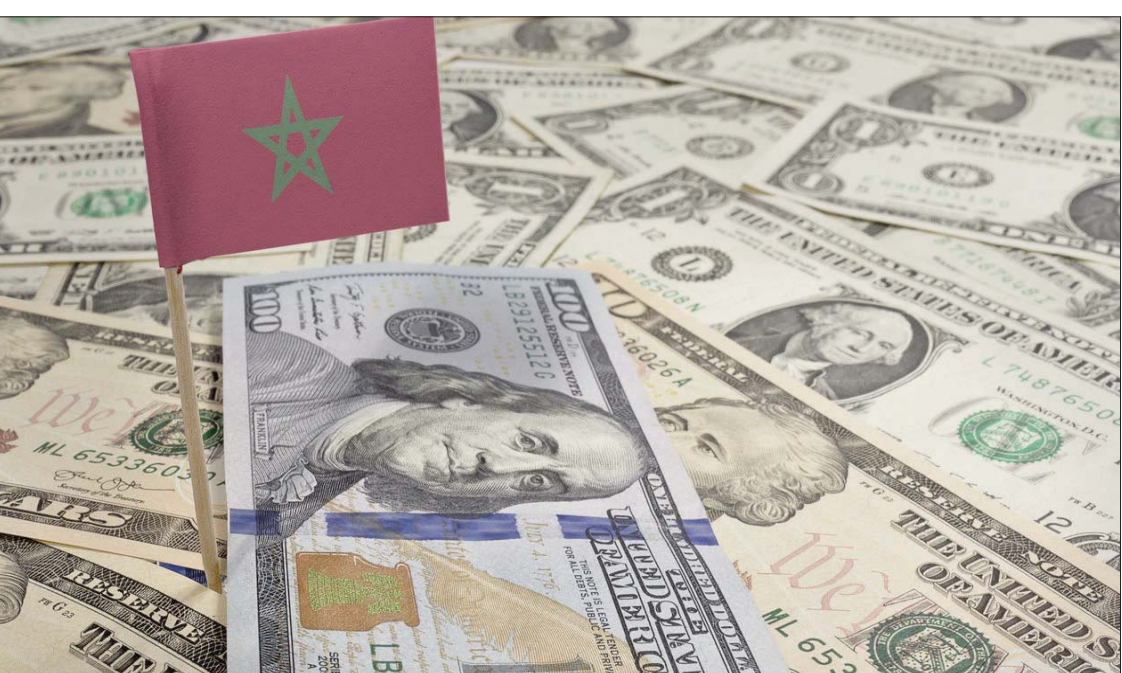
علم المغرب بجانب فئات متنوعة من العملة الأمريكية الدولار

وأضاف مكتب الصرف أن ارتفاع واردات السلع شمل أغلب أصناف المنتجات، لافتاً إلى أن الفائرة الطاقية ارتفعت بـ 29,6