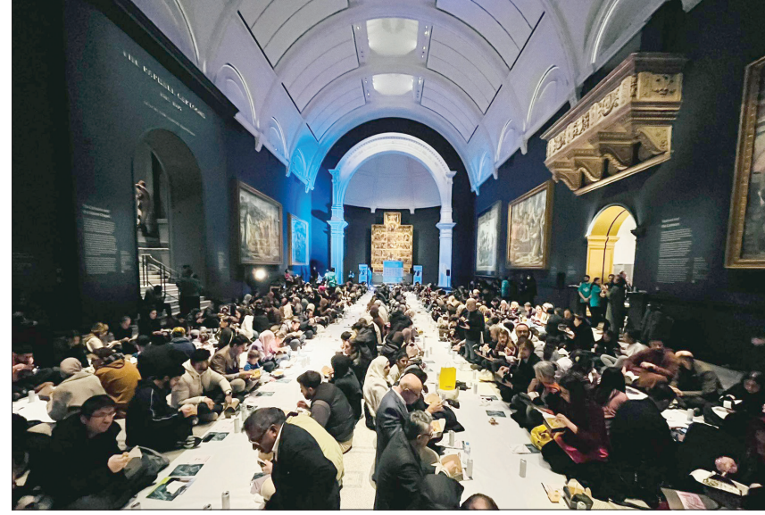
إفطار جماعي في قاعة «رافايل» بمتحف «فيكتوريا أند ألبرت» (تويتز)