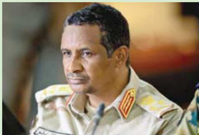
قائد قوات الدعم السريع الفريق محمد دقلو «حميدتي»