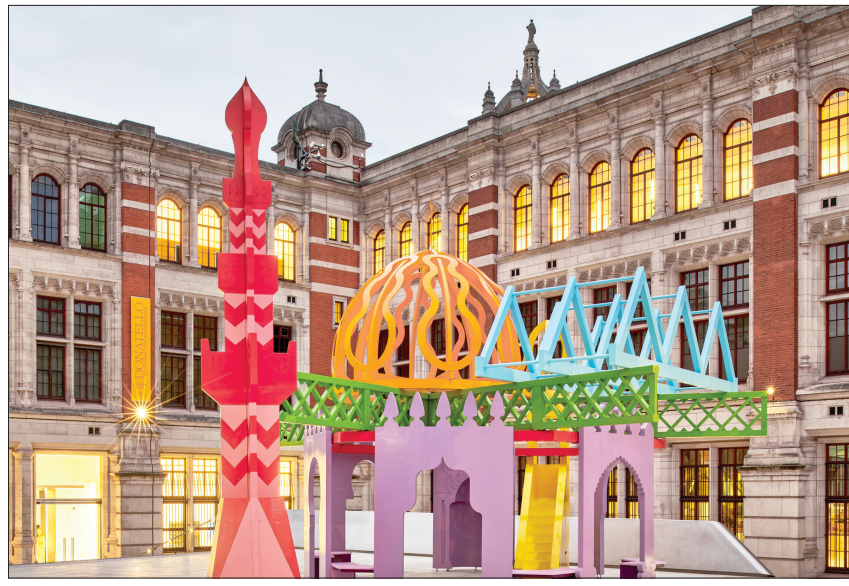
«جناح رمضان» في متحف «فيكتوريا أند ألبرت» (المتحف)

الجناح أنبت في أول عشرة أيام من رمضان أنه إضافة قيمة