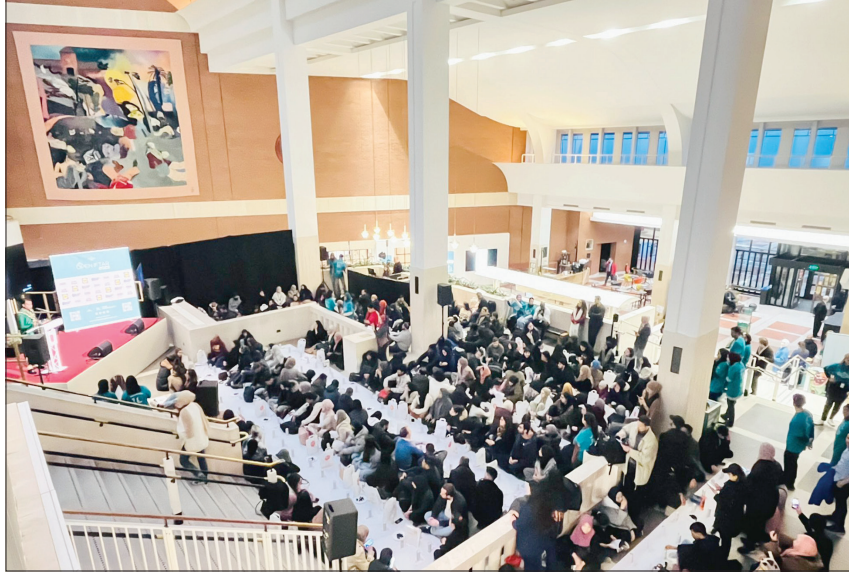
إفطار جماعي مفتوح في المكتبة البريطانية بلندن (تويتز)

الأسبوع الماضي اجتمعت أعداد كبيرة في إحدى قاعات المتحف لتناول الإفطار سوياً، فرشت السفرة الرمضانية، واجتمع حولها جمع متنوع من المسلمين وغير المسلمين لتناول وجبة بسيطة تتكون من التمر والحلوى وطبق من أرز البرياني، بدأت الأجواء مطمئنة وسعيدة، قام المؤذن برفع الأذان في مساحة مفتوحة في مدخل المتحف، واصطف المصلون خلفه في صلاة الجماعة. علق عمر صالح على «تويتز» قائلاً: «ليلة