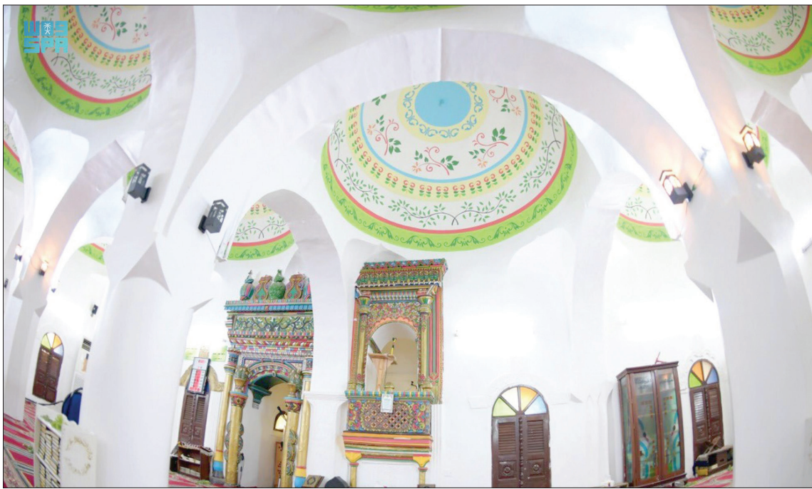
مسجد النجدي يُعد واحداً من المعالم التراثية في جزيرة فرسان