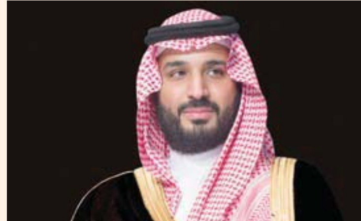
جدة، «الشرق الأوسط»

التأكيد على عمق الروابط الأخوية والعلاقات الثنائية بين السعودية ودولة الإمارات العربية المتحدة.