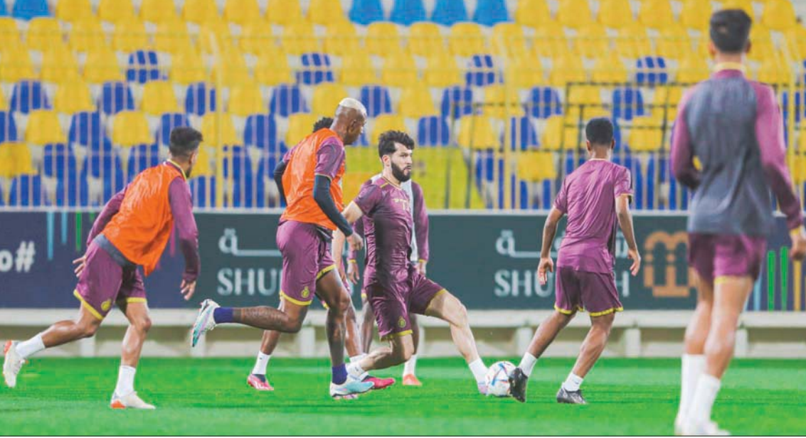
من استعدادات النصر لاستئناف الدوري السعودي