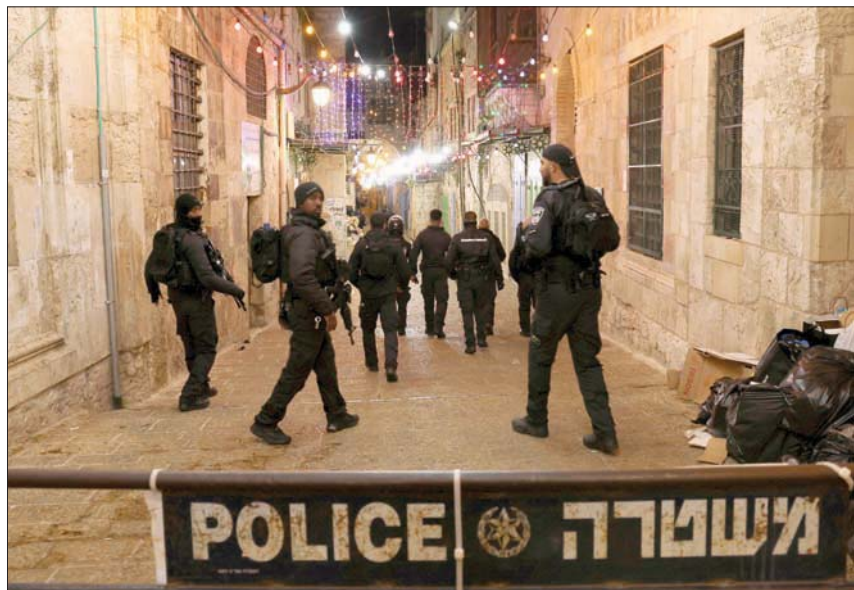
حاجز للشرطة الإسرائيلية لقطع طريق مؤدية إلى المسجد الأقصى فجر أمس