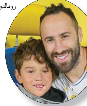
الحارس أوسبينا بدأ يتعافى من إصابته

قبل أن يشارك الدون في تلك المباراة ليصعد إلى عمادة اللاعبين حول العالم ويضيف إليها مباراة لوكسمبورغ التي تلتهها. وبدأت علاقة الدون كريستيانو رونالدو بمنتخب بلاده في 2003. وهو العام نفسه الذي بدأ بدر المطوع اللعب. ويذكر أن الدون أثنى على مستوى الدوري السعودي للمحترفين لكرة القدم، متوقفاً أن يكون في مصاف أقوى خمس بطولات دوري في العالم في المستقبل القريب. وقال رونالدو في مؤتمر صحفي: «أنا مندهش، يتمتع اللاعبون الأجانب بقدرات مختلفة». وأضاف: «في غضون خمس أو ست أو سبع سنوات على الأكثر، ستكون بطولة الدوري السعودي الرابعة أو الخامسة بين الأكثر تنافسية في العالم إذا استمرت على الخطة نفسها. أشارك وأحظى بدقائق للعب». ويحتل رونالدو المركز السادس في قائمة هدافي