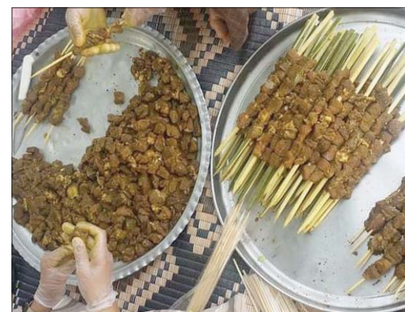
للحم المشوي على الطريقة العمانية بهاراتها المميزة

ويشدد البادي، على استخلاص الكثير من مكونات المطبخ العماني من البيئة المحلية؛ مثل ماء الورد الجبلي والزعر الجبلي وزيت الزيتون والسمن وبعض أنواع التمور واللبن.