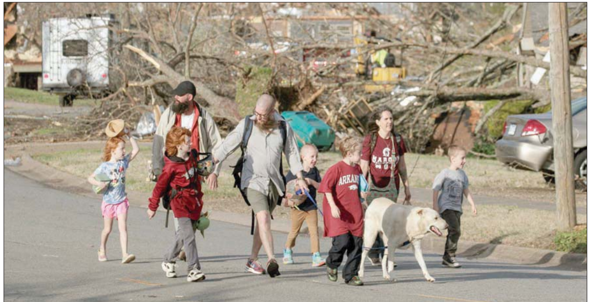
أسرة تغادر حياً مدمراً بفعل إعصار أركنسو في مدينة ليتل روك الجمعة

لقي ثلاثة أشخاص على الأقل مصرعهم في إعصار قوي ضرب ولاية أركنسو (جنوب الولايات المتحدة)، بينما قتل ثلاثة آخرون في الشمال بسبب عواصف شديدة في إيلينوي وإنديانا، كما أعلنت السلطات الأمريكية.