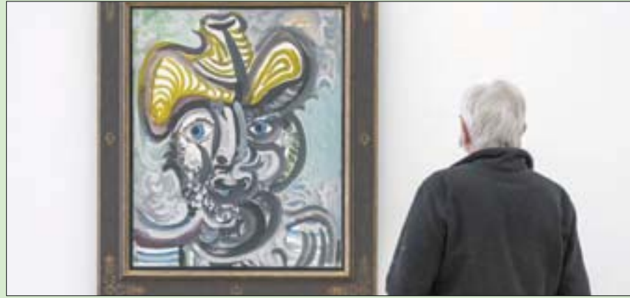
معرض «بيكاسو الفنان والنموذج» في سويسرا واحد من عشرات المعارض التي بها

خزفيات بيكاسو، وبيكاسو والنسوية، والأبيض في أعمال بيكاسو، وبيكاسو بعدسة أشهر المصورين، وبيكاسو الشاب في باريس، وبيكاسو النحات... مواضيع كثيرة تعالجها الأنشطة المختلفة المقامة بمناسبة «سنة بيكاسو» في فرنسا وإسبانيا. ولا يزال بيكاسو «متفوقاً على الجميع»، حسب الرئيس الفرنسي لـ «مركز مومبيدو» في باريس بمراسم بليستين، الذي يتنيد على غرار غيره من المتخصصين بـ «عقريته» صاحب الكثير من الأعمال الشهيرة، بينها «غيرنيكا» و«ناس أفينيون». ويوضح لوكالة الصحافة الفرنسية، إن «القوة المدمرة لعمل