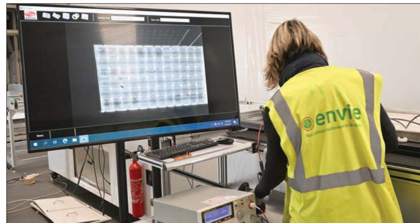
مختبر للألواح الشمسية بالقرب من بورديو بفرنسا 9 فبراير الماضي

العالمية للألواح الكهروضوئية المستهلكة نحو 4 في المائة من عدد الألواح المركبة. وتحتذر الوكالة من أن حجم نفايات الألواح الشمسية سيرتفع إلى ما يقل عن 5 ملايين طن سنوياً بحلول منتصف القرن الحالي، وبكمية تراكمية تبلغ 60 مليون طن بحلول 2050.