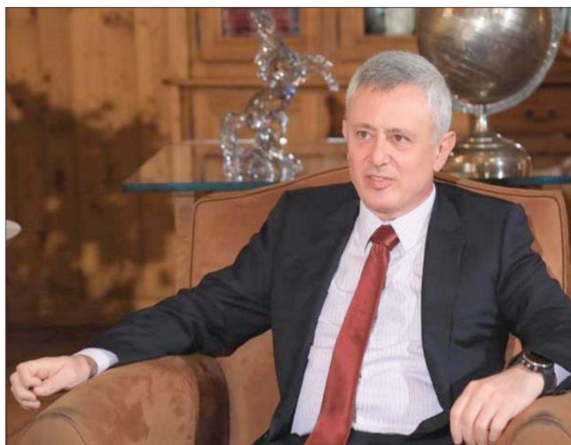
سليمان فرنجية

بيروت، نذير رضا سلك ملف الانتخابات الرئاسية في لبنان، بعد تبني ثنائي «حركة أمل» و«حزب الله» لترشيح رئيس تيار «المردة» سليمان فرنجية، مساراً مغايراً للتوقعات السابقة لجهة الاتفاق على مرشح واحد يفوز بأكثرية ثلثي أعضاء المجلس النيابي. ويات مسار ملف رئاسة الجمهورية، بعد دخول الشغور في هذا الموقع شهره الخامس، أكثر وضوحاً في ظل الانقسام بين القوى السياسية، ولم تعد المعادلة قائمة على اختيار المرشح، بقدر ما باتت قائمة على «من يؤمن نصاب جلسة الانتخاب»، في إشارة إلى تأمين نصاب الثلثين في جلسة الانتخاب الثانية التي تتطلب حضور 86 نائباً من أصل 126، وفوز المرشح بأكثرية الأصوات، بعد الدورة الأولى التي تتطلب الحضور كما الاقتراع للمرشح الفائز بأكثرية الثلثين.