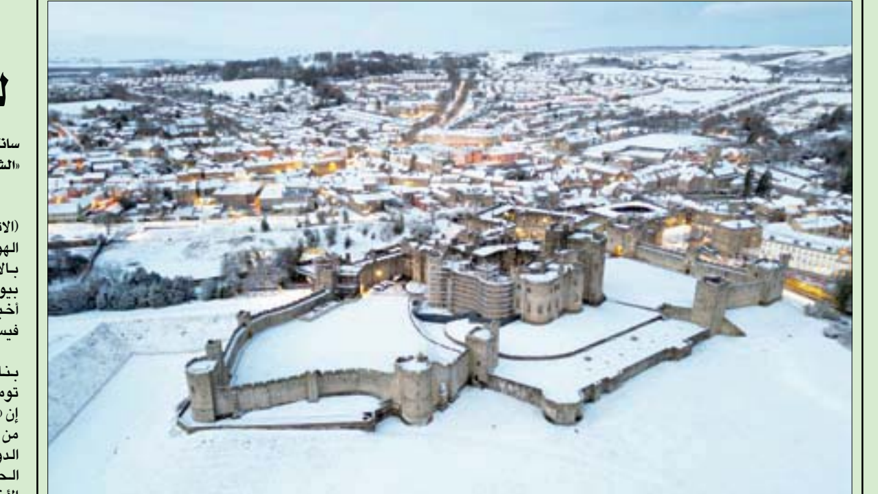
تغطي الثلوج قلعة النويك والحقول المحيطة بها في مقاطعة نورثمبرلاند الإنجليزية وقد صدرت تحذيرات من تساقط الثلوج في جميع أنحاء بريطانيا

هذه الحديقة مهمة للغاية ليس فقط لتشيلي ولكن للعالم، مضيفة أن جنوب تشيلي مصدر مهم لعزل الكربون بسبب مستنقعات الخث والغابات البكر. وأردفت: «هذا (هدف عظيم) للحفاظ على الطبيعة ومكافحة أزمة تغير المناخ». يُعد الهويمول أحد نوعين من الغزلان المحلية التي توجد فقط في غابات باتاغونيا في الأرجنتين تشيلي. لكن تدهور الظروف البيئية هوى بأعدادها إلى أقل من واحد في المائة من أعدادها الأصلية، وفقاً لبيانات وزارة الزراعة التشيلية.