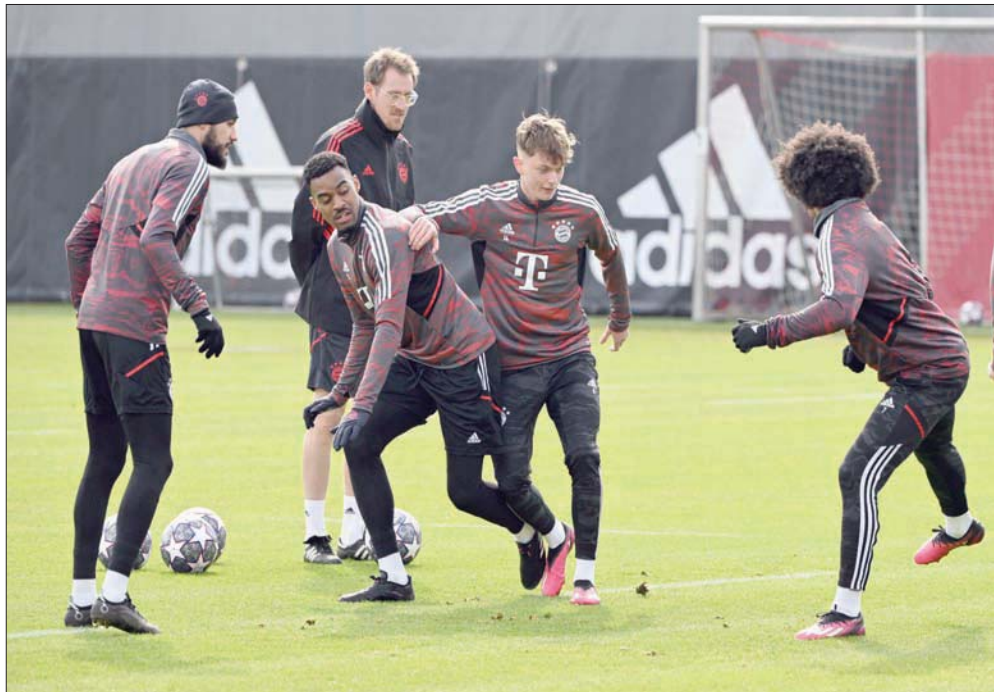
لاعبو البايرن متحمسون في التدريبات قبل مواجهة سان جيرمان المصيرية

معركة طاحنة مع بوروسيا دورتموند على صدارة البوندسليغا هذا الموسم، صوفوه بالمهاجم السنغالي ساديو ماني وقلب الدفاع الهولندي ماتيس دي ليخت، بعد تعافيهما من الإصابة.