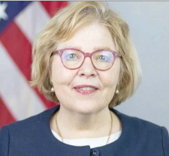
باربرا ليف مساعدة وزير الخارجية الأميركي (الشرق الأوسط)

وشددت باربرا على أن بلادها ملتزمة بالحفاظ على الأمن الإقليمي والعالمي، وهو الالتزام الذي يشمل جهودها لمواجهة الأنشطة المزعزعة للاستقرار من الفاعل الإقليمي. ووصفت محاولات الحوثيين في اليمن لاستيلاء على السلطة بالقوة «تحدى الإجماع الدولي»، وهو ما يظهر في الكثير من القرارات التي أصدرها مجلس الأمن الدولي، وفي حديثها عن «حزب الله» اللبناني، أشارت باربرا إلى أن الولايات المتحدة صفت الحزب منظمة إرهابية، مبيّنة أن هذه المنظمة «لعبت دوراً مزمعاً