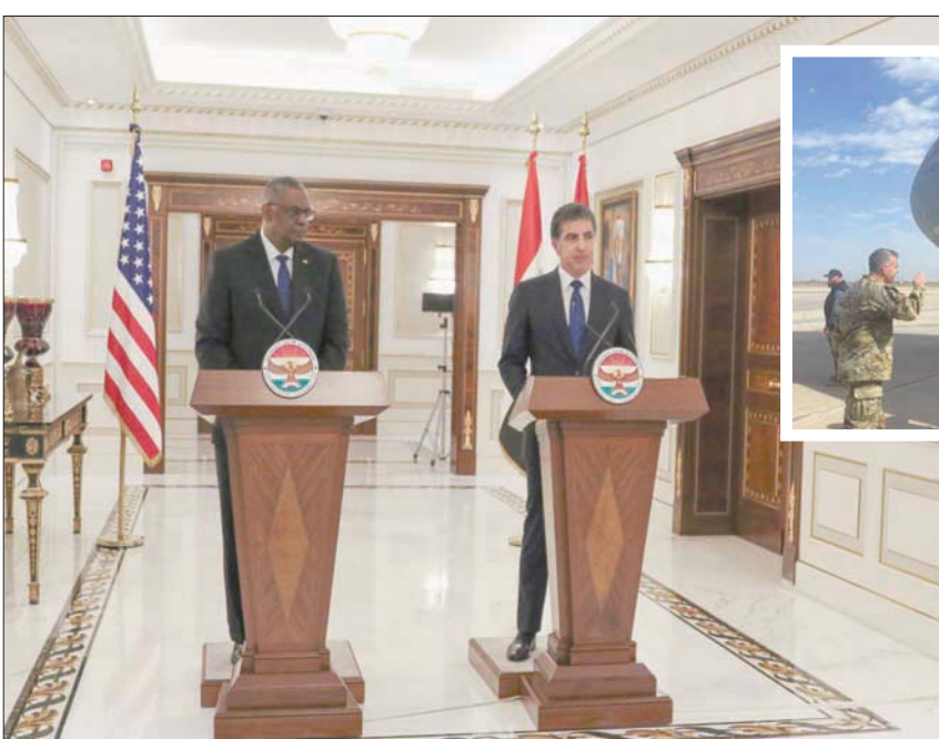
رئيس إقليم كردستان نيجيرفان بارزاني مع وزير الدفاع الأميركي في أربيل أمس

بدوره، أشار أوستن إلى العمل المشترك بين الجانبين في مدى أكثر من 10 أعوام، مضيفاً: «قد حرنا الأجهزة الأمنية من أسلحة تتناسب مع الحرب المقبلة ضد تنظيم داعش، وهي حرب استخبارات ومعلومات مساحية واسعة من داعش بالتعاون مع التحالف الدولي». كما أكد دعم بلاده لمذكره التفاهم بين البشمركة المتعاونين الاستراتيجيين، خصوصاً إذا علمنا أنه لا توجد قوات مشاة أجنبية على الأرض، ولا قوات قتالية