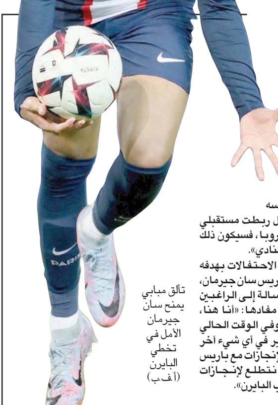
تألق مبابي بمنح سان جيرمان الأمل في تحطيم البايرن

ويعدول مدرب ميلان ستيفانو بيولي، على استعادة مهاجمه البرتغالي رافايل ليغو مستواه السابقة، لإنقاذ موسمهم، حيث يتعد 18 نقطة عن نابولي المتصدر والمتجه نحو لقبه الأول في الدوري المحلي منذ أكثر من ثلاثة عقود. ورغم أن الجناح الدولي ابن 23 عاماً لم يظهر بالمستوى الرابع الذي قدمه قبل مونديال قطر نهاية العام الماضي، إلا أنه سجل جرة ثقة إضافية والمزيد من التهديد للهجوم بدأ من دون «اسنان» وعاجزاً أمام فيورنتينا. في المقابل، يعود المدرب الإيطالي الأنطوني كونتي، لقيادة المباريات.