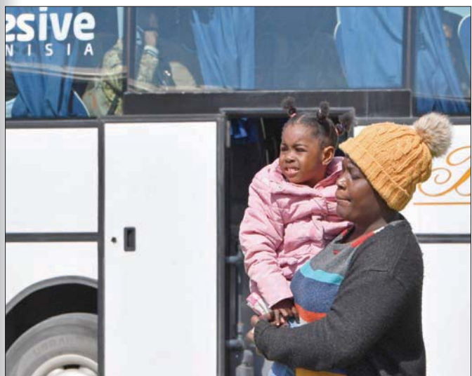
مهاجرة أفريقية تحمل ابنتها لدى وصولها إلى مطار قرطاج الدولي استعداداً لمغادرة تونس

وارتفع مؤشر أسعار المستهلكين، باستخدام الإجراءات المقترضة، الذي يستخدم لحساب مؤشر الأجور الحقيقية، بنسبة 5,1 في المائة في يناير الماضي مقارنة بالفترة نفسها من عام 2022، وسط ارتفاع