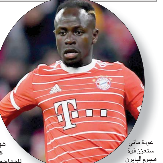
عودة ماني ستعزز قوة هجوم البايرن

ميونخ (ألمانيا) «الشرق الأوسط» يمتلك مدرب بايرن ميونخ الألماني بوليان ناغلسمان، الباحث عن إزاحة باريس سان جيرمان الفرنسي، اليوم، من ثمن نهائي دوري أبطال أوروبا في كرة القدم، لاعباً «جوكر» بمقدوره إيصال سفينة الفريق البافاري إلى بز الأمان، هو ساديو ماني. كان عام 2022 مثالياً «تقريباً» للمهاجم السنغالي المميز، فقد حصد