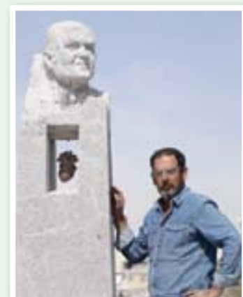
القاهرة: رشا أحمد

احتفى مصريون على مواقع التواصل الاجتماعي، بتمثال يجسد شخصية جراح القلب المصري العالمي، الدكتور مجدي يعقوب. وتداول رواد مواقع التواصل الاجتماعي صور التمثال، مصحوبة بعبارات الإشادة بالبطيب المصري الذي يحظى بشعبية لافتة، والتمثال من أعمال الفنان المصري ناثان دوس، وتحتته مستخدماً حجر الغرانيت، على هامش فعاليات الدورة الـ 27 لسمبوزيوم أسوان الدولي للنحت، التي عُقدت في الفترة من 27 يناير (كانون الثاني) الماضي، حتى 4 مارس (آذار) الحالي، في أسوان (جنوب مصر). وقال دوس لـ «الشرق الأوسط»: إن «عملية التخليد النهائي للتمثال في أسوان على حجر الغرانيت الأحمر استغرقت 22 يوماً، وسبقها مرحلة التحضيرات والمخططات الأولية على الورق، والتي تمت في مرسمه بالقاهرة». وأوضح، أن «التمثال مشيد على قاعدة تتضمن أربع نوافذ تمثل حجرات القلب الأربع، وداخل الحجرة قلب معلق وشععة موقدة لتشير الطريق أمام اليائسين». ولفت دوس إلى أن «العمل يتضمن رسالة محبة وامتنان وتقدير لجراح عالمي، أشتهر بمساعدة غير القادرين، ولم تغره الشهرة». وقال: إنه «حرص على تجسيد ابتسامه مجدي يعقوب التي تدخل القلوب من دون استئذان». وبشأن ما إذا كان تنفيذ التمثال يتعارض مع منصبه ك«مؤسس سمبوزيوم أسوان النحت الدولي»، لا سيما أن وظيفة المؤسس هي الإشراف على السبوزيوم وتنظيمه وتنفيذه دون تقديم أعمال فنية، أكد دوس «عدم وجود تعارض».