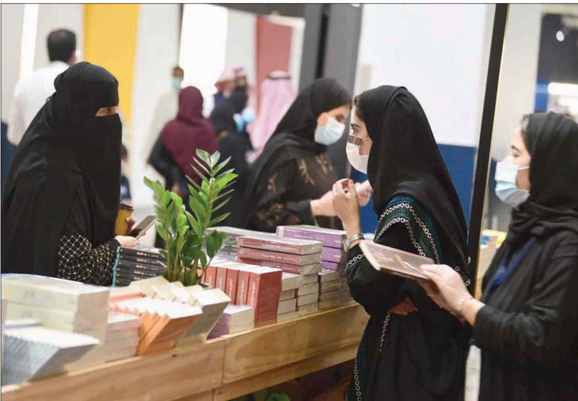
مشاركة السعوديات في معظم النشاطات المحلية والخارجية مكتتهن من تبوء مناصب مختلفة (الشرق الأوسط)