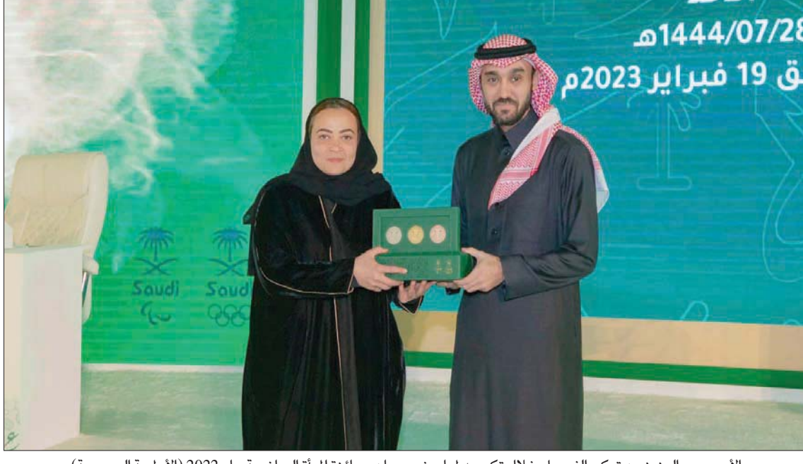
الأمير عبد العزيز بن تركي الفيصل خلال تكريمه لمياء بنت بهيان بجائزة المرأة الرياضية عام 2022

لعم أن كل ما تم تحقيقه حتى هذه اللحظة هو مجرد بداية لما سيأتي مستقبلاً، فطموحاتنا كبيرة لا حدود لها. ● لم نر حتى اللحظة منتخبات للنشائات والشابات للمنتخب السعودي... هل هناك خطة قريبة حيال ذلك؟ - لقد أعلننا بالفعل الشهر الماضي عن تأسيس المنتخب الوطني للنشائات تحت 17 عاماً، حيث خاضت اللاعبات ثلاثة معسكرات تدريبية حتى الآن. وخاض منتخب الناشئات أول مباراة رسمية ضد ناشئات الكويت قبل أيام عدة، تحظى المنتخبات الوطنية للشباب بأهمية كبيرة عندما تخطط لتطوير اللعبة ككل وبناء نجوم المستقبل للمنتخب الأول. ● هل هناك تدريبات سعوديات يقدن الأندية النسائية، وهل هناك خطط بشأن تدعيم الأجهزة الفنية