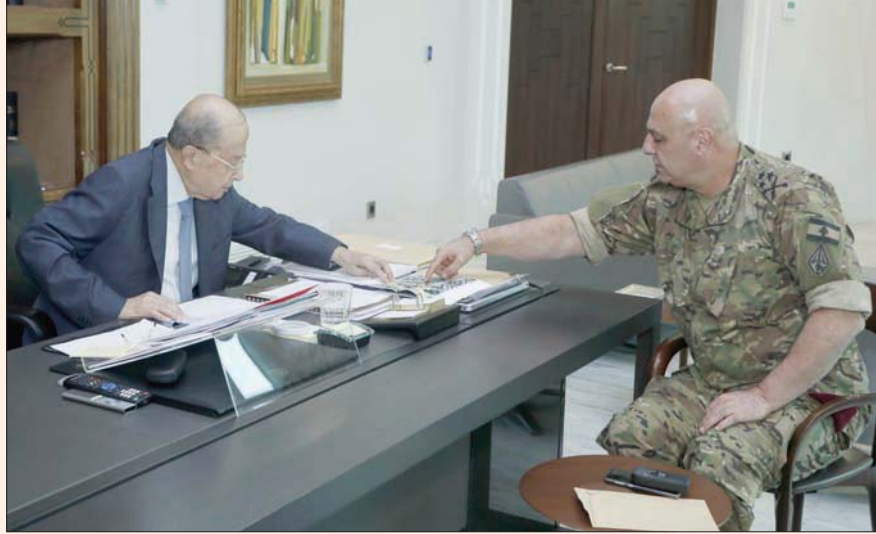
من لقاء بين الرئيس السابق ميشال عون وقائد الجيش العماد جوزيف عون في أكتوبر 2021

بيروت، محمد شقير نقل عن رئيس الجمهورية السابق إن الأجهزة الأمنية لم تتحرك كما يجب لمنع التحجعات؛ من قطع الطرقات وتنظيم الحملات التي استهدفت شخصياً، محملاً إياها مسؤولية ما بلغته الأزمة من تصعيد كاد يأخذ الجبل إلى مكان آخر.