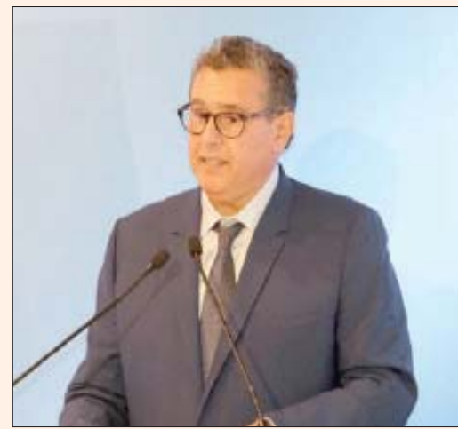
عزير أخنوش رئيس الحكومة المغربية

الرباط، «الشرق الأوسط» أعلن «المجلس الوطني لحقوق الإنسان» في المغرب (مؤسسة دستورية تهتم بحقوق الإنسان) عن إحداث «مجموعة عمل» حول مقترح مراجعة «مدونة الأسرة»، وذلك في سياق مساع تروم تعديل «مدونة الأسرة المغربية»، وسط جدل بين المحافظين ومثليين في الإسلاميين من جهة؛ والليبراليين؛ من جهة أخرى.