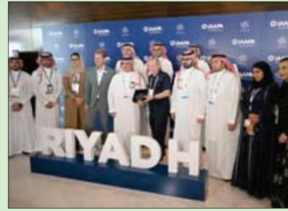
مشاركون في المنتدى الدولي للترفيه

كما يضم المنتدى معرضاً مصاحباً تشارك فيه العديد من الشركات المحلية والعالمية؛ بهدف عرض منتجاتها وخدماتها التي تلبى احتياجات صناعة الترفيه وتبادل الخبرات بين الشركات لدعم القطاع.