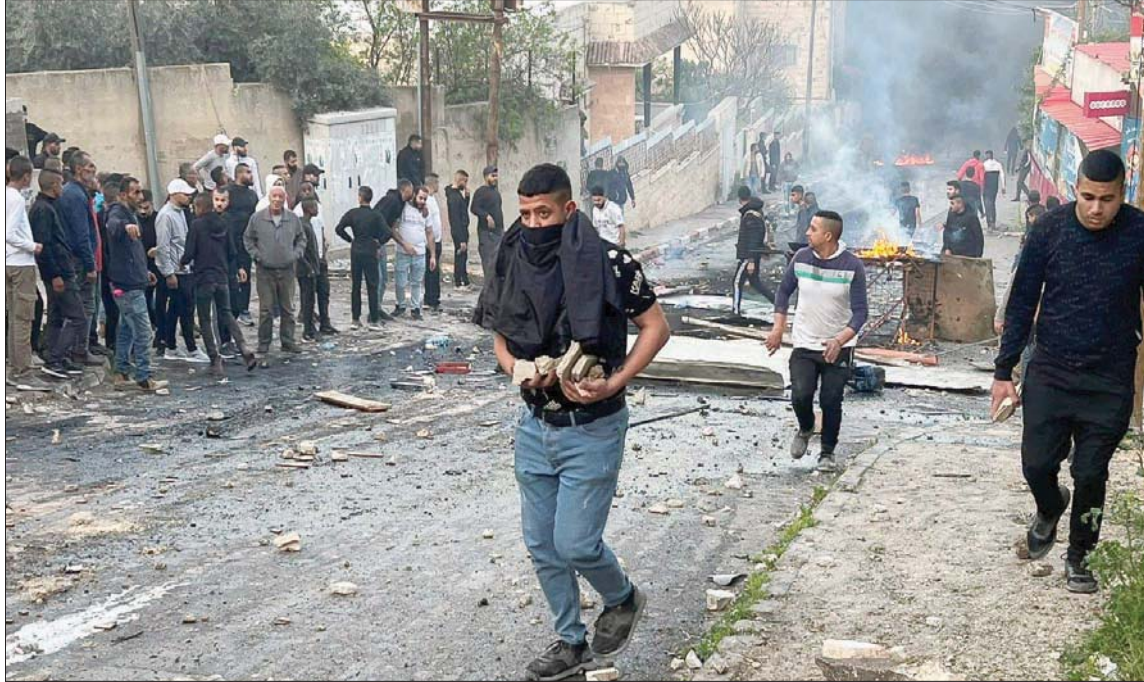
اشتباكات بين فلسطينيين وقوات إسرائيلية خلال اقتحام مخيم جنين بالضفة الغربية الثلاثاء، (رويترز)

عربية، ثم حاصرت منزلاً قبل أن تندلع اشتباكات عنيفة هناك استخدم فيها الجيش الإسرائيلي طائرات مسيرة وقوة نيران كثيفة، تضمنت إطلاق صواريخ محمولة تجاه المنزل الذي كان يتحصن فيه أربعة فلسطينيين قبل أن يقضوا. وحول الجيش مخيم جنين إلى ساحة حرب اندلعت فيها مواجهات مسلحة وشعبية، أطلقت خلالها صواريخ، وسمعت أصوات انفجارات غطت مع سيارات الإسعاف والدخان الكثيف على المشهد هناك، قبل أن يسقط مقاتلون طائرة درون إسرائيلية، وفي أثناء الاشتباكات أصيب اثنان من وحدات «اليمام» الإسرائيلية الخاصة. وخروشة قيادي في حركة «حماس» من مخيم عسكر الجديد في نابلس، أسير محرر قضى في السجون الإسرائيلية 8 سنوات، وأفرج عنه قبل شهرين فقط. وفي أثناء محاصرته خروشة في جنين، اقتحم الجيش الإسرائيلي، مخيم عسكر في نابلس مسقط رأس خروشة، واعتقل اثنين من أبناءه على الأقل. وقال ناطق باسم الجيش، إن العملية في مخيم جنين وفي نابلس مرتبطتان. وجاء الهجوم على مخيم جنين في وقت تحاول فيه الولايات المتحدة والأردن ومصر، تثبيت