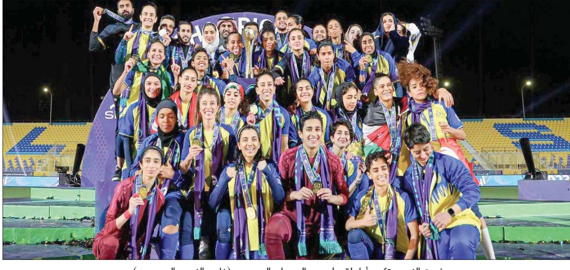
فريق النصر توج بأول لقب لدوري السيدات السعودي (نادي النصر السعودي)

كل ما تم تحقيقه حتى هذه اللحظة هو مجرد بداية، فطموحاتنا لا حدود لها ● أكثر من 50 لاعبة من 20 دولة يشاركن مع أندية دوري السيدات