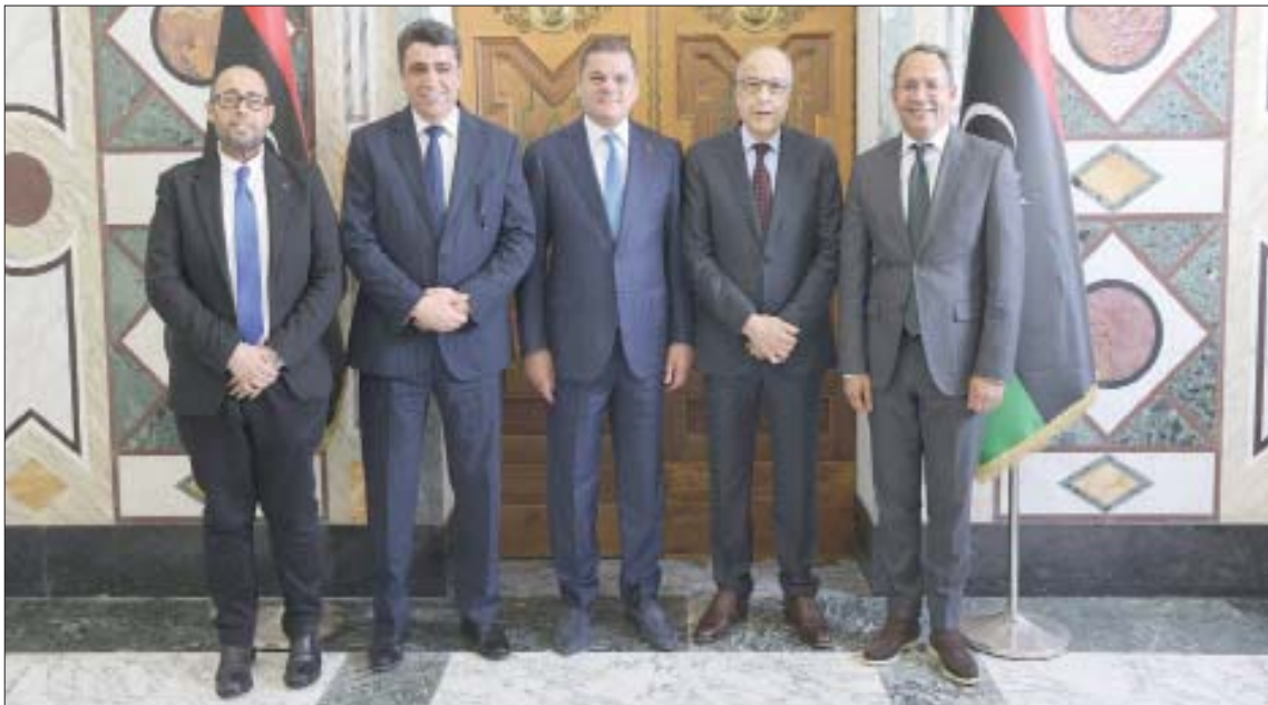
الديببة خلال اجتماعه مع مسؤولين حكوميين لبحث الاستعدادات لشهر رمضان المبارك

كما بحثت المنقوش مع عبد الله اللافي، نائب المنفي، دور وزارة الخارجية في التنسيق، ودعم جهود المجلس الرئاسي واللجنة رفيعة المستوى للاتحاد الأفريقي في إنجاز مشروع المصالحة الوطنية بليبيا.