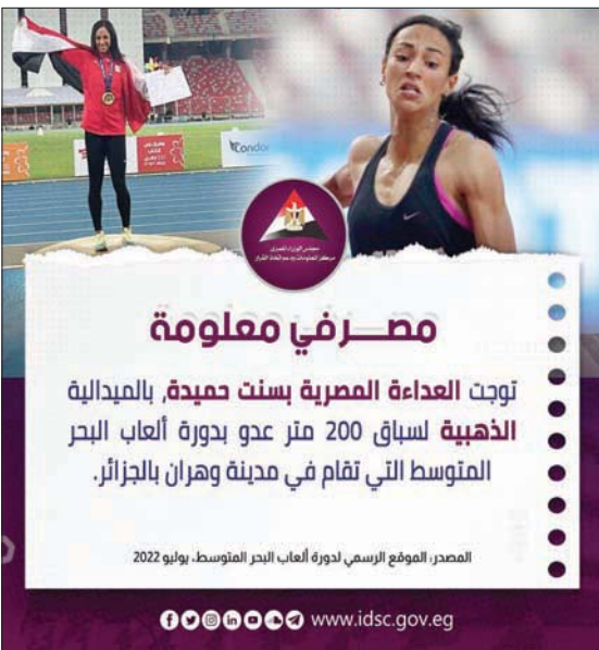
الجانب من احتفاء مصر بتمكين المرأة رياضياً

التغيير المناخي مع مراعاة تمكين المرأة، فكان ذلك من خلال الحملات التوعوية للنساء بالأساليب الزراعية الصديقة للبيئة، ومبادرات تعريفها بأساليب الحد من الانبعاثات غازات الاحتباس الحراري. وارتكز الطرح الدولي لرؤية مصر للمرأة والبيئة وتغير المناخ على 7 ركائز، وكان أبرزها: إشراك المرأة في مراحل الحوكمة البيئية، والتوعية وإنتاج السلوكي، وتعزيز إنتاج البيانات ذات الصلة بقضايا المرأة، وغيرها. ولفت المجلس إلى أنه تم تمكين أكثر من 3 آلاف رائدة أعمال، (3188 رائدة أعمال)، في مجال التربية الحيوانية. واستعرض كذلك