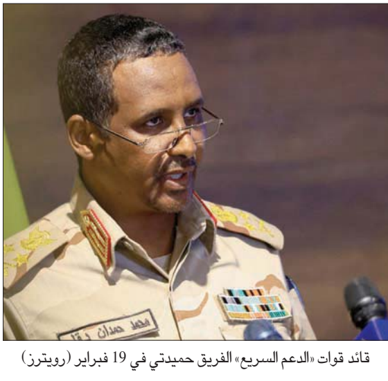
قائد قوات الدعم السريع، الفريق حميدتي في 19 فبراير

ويأتي حديث قائد قوات الدعم السريع، في سياق حرب كلامية اشتعلت بين الطرفين خلال الأسابيع الماضية، تضمنت تصريحات من قادة الجيش وقادة «الدعم السريع» حول دمج الأخيرة في الجيش وحول الاتفاق الإطاري الذي وقعه الطرفان ويقضي بتسليم السلطة إلى المدنيين وعودة العسكريين إلى الثكنات. وفي 18 يناير (كانون الثاني) 2017 أجاز البرلمان أثناء حكم الرئيس المعزول عمر البشير، «قانون قوات الدعم السريع»، ثم انتقلت تبعيتها لاحقاً من إمرة جهاز الأمن والمخابرات إلى القوات المسلحة السودانية (الجيش)، ونص القانون على أنها قوات تابعة للقائد العام للجيش. وتقول ديباغة القانون إن