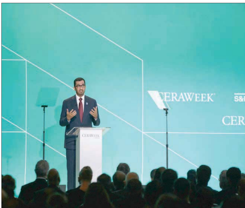
وزير الصناعة والتكنولوجيا المتقدمة الإماراتي سلطان الجابر يتحدث خلال أسبوع «سيرا ويك» المعني بالطاقة في هيوستن بتكساس الأميركية أول من أمس

بمتمتع كلا الجانبين بطلب عالي قوي على النفط والغاز، وحققا أرباحاً قياسية خلال العام الماضي. وتلاشى التنافس بينهما مع استقرار طفرة النفط الصخري التي أوصلت الولايات المتحدة إلى قمة منتجي النفط العالميين، وقلصت حصة «أوبك» في السوق.