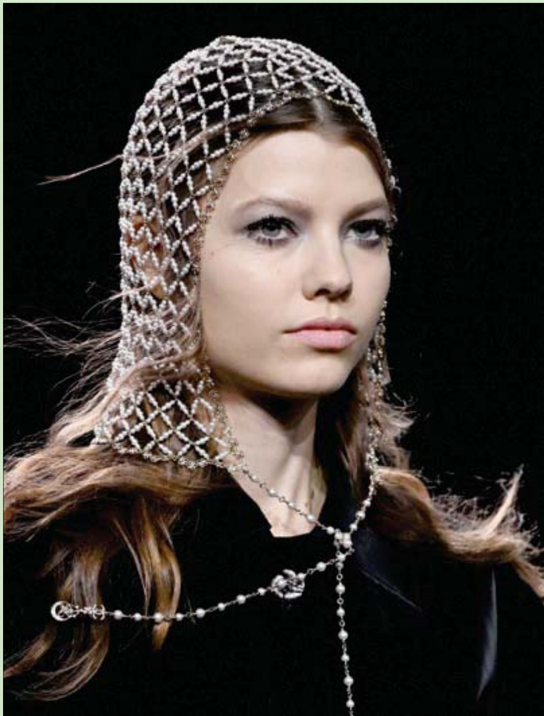
عارضة تقدم تصميماً من مجموعة «شانيل» النسائية لخريف وشتاء 2023 - 2024 خلال أسبوع الموضة في باريس

أما في المغرب فإن «إخوان» المغرب ولجوا صلب النظام السياسي الملكي المغربي، وكانوا على قدر من البراعة، رغم زلزال الربيع العربي، لكن الملك المغربي محمد السادس ورجال «المخزن»، نجحوا في عبور الأمواج حينذاك باقٍ قدر من الخسائر والتنازلات، التي كان الكاسب الأكبر منها هم «الإخوان» وحزبهم، إلى وقت قريب، لكن جرت في ساقية مياه «الإخوان» مياه كثيرة ليست على هوى السفن الإخوانية المغربية. جوهر الكلام، هو أن الخلافات والتمايزات، وإن بدت خشنه، بين جماعات «الإخوان» في البلدان العربية والمسلمة، لا تمس صلب الفكرة المؤسسة، ففكرة النوصاية على الهوية الإسلامية وتوظيف الدين في بورصة السياسة، واستنزاف رأس المال الرمزي للأمة كلها في مضاربات السلطة.