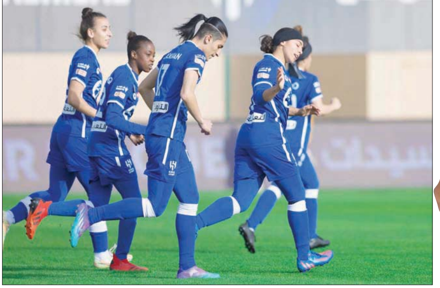
فريق الهلال للسيدات نافس بقوة على أول لقب للدوري السعودي