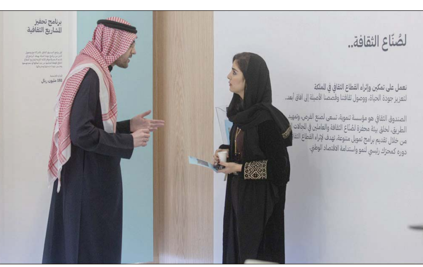
حظي القطاع الثقافي السعودي بمجموعة من المبادرات النوعية والمبتكرة

من جانب آخر، وكجزء من الاستراتيجية الوطنية للثقافة، أطلقت منصة التراخيص والتصاريح الثقافية «إبداع» التي تفتح باب الشراكة مع القطاع الخاص، وتقدم الدعم وتمكين للنشاط الثقافي في المملكة، حيث تتيح خدمة إصدار التراخيص والتصاريح الثقافية للمنشآت والممارسين والهواة السعوديين والمقيمين؛ لتمكينهم من ممارسة الأنشطة الثقافية الداعمة والإسهام في نمو القطاع والرفع من كفاءته وجاذبيته الاستثمارية، بما يجعل من الثقافة عاملاً مؤثراً في الاقتصاد الوطني، ومجالاً حيويًا فعّالاً يحقق مستهدفات «رؤية المملكة 2030».