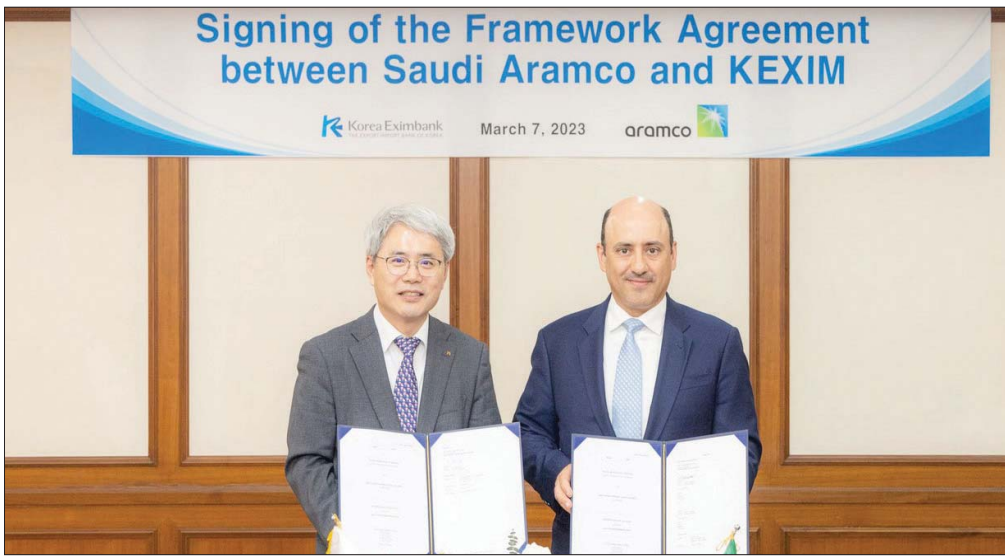
جانب من توقيع الاتفاقية بين بنك كوريا للتصدير والاستيراد و«أرامكو السعودية» في سيول أمس

ويمكن الاتفاق الإطاري بنك كوريا للتصدير والاستيراد من إقراض ما يصل إلى 6 مليارات دولار لـ«أرامكو»، التي بدورها تدفع للشركات الكورية الجنوبية، المشاركة