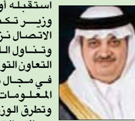
فيصل بن تركي آل سعيد