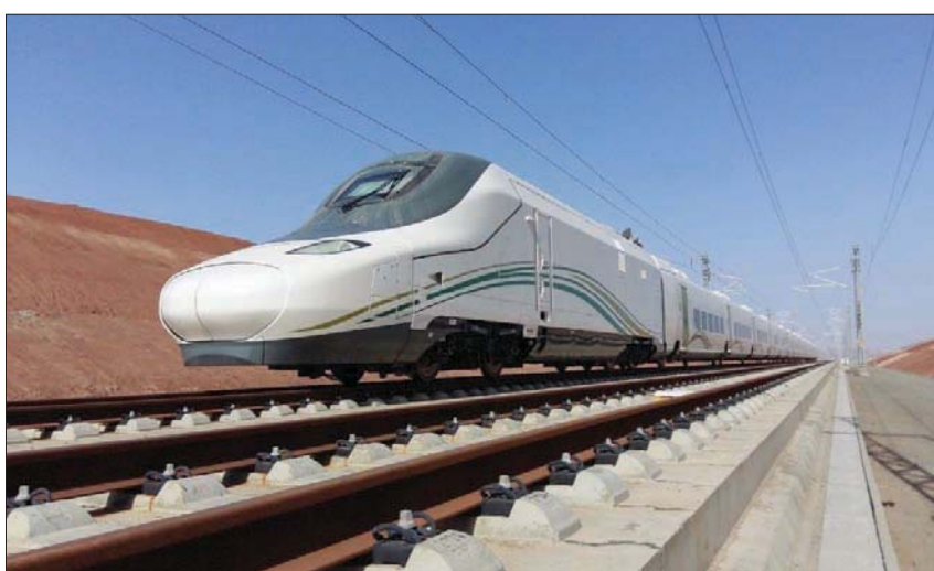
مشروعات القطار والسكك الحديدية ستحدث نقلة في نشاط النقل والخدمات اللوجيستية (الشرق الأوسط)

وفق الدراسة فإن القطاع يعظم زيادة أطوال السكك الحديدية من 5500 كم حالياً، إلى 13 ألف كم، بنسبة زيادة تبلغ 160 في المائة، وزيادة عدد الحاويات التي تنقلها الخطوط لأكثر من 40