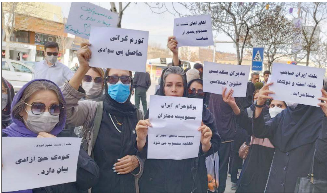
صورة نشرتها اللجنة التنسيقية لنقابيات المعلمين لمعلمات يرفعن شعارات تندد بالهجمات السامة أمس

تلندن، عادل السالبي تواجه السلطات الإيرانية موجة جديدة من الغضب الشعبي مع استمرار «هجمات التسمم» الغامضة على مدارس الفتيات، إذ نظم المعلمون مسيرات منددة بالاعتداءات. ويديرها أعلنت وزارة الداخلية عن «اعتقال البعض ونُصَح البعض» في خمس محافظات، فيما وجه الادعاء العام الإيراني اتهامات إلى صحفيين ومنتقدين، وذلك في وقت اتهمت الناشطة الإصلاحية البارزة زهرا رهنورد، المؤسسة الحاكمة بالانتقام من طالبات المدارس والجامعات على أثر انتفاضة «المرأة، الحياة، الحرية». وتجددت هجمات التسمم في عدد من المدن الإيرانية. ففي مدينة زاهدان، مركز محافظة بلوشستان، أعلن رئيس جامعة العلوم الطبية، 41 تمديدًا ومدروس جرى نقلهم إلى مستشفى في المدينة بسبب معاناتهم من أعراض الفتيان ووجع في البطن، موضحة أن خمس سيارات إسعاف وحافلة شاركت في عملية إسعاف الطالبات.