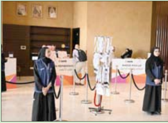
المشاركون في المنتدى الدولي للترفيه

اللازم لقيادات فعالياته وبرامجه. وتضمّن المنتدى عدداً من البرامج التدريبية، مثل برنامج التطوير المهني لمديري الجهات الترفيهية IAM الذي يستهدف المندوبين وصناع القرار في الشركات العاملة بقطاع الترفيه، ويشتمل على جلسات ذات موضوعات متخصصة مثل زيادة الإيرادات في الجهات الترفيهية، واكتشاف المشروعات الترفيهية تحت التطوير في السعودية، وغيرها.