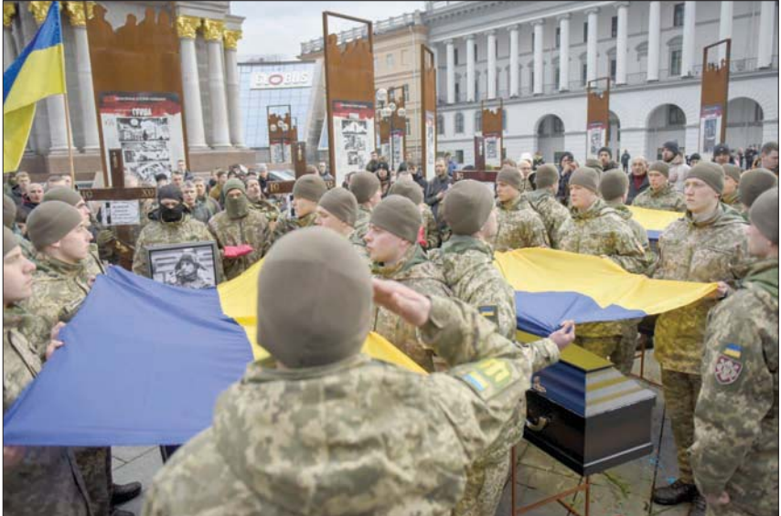
حرس الشرف في كييف يودعون الثلاثاء 4 من عناصر وحدات خاصة سقطوا في الحرب

ويرى محللون أن تردد إدارة بايدن في تسليم تلك الطائرات المقاتلة، هو نتيجة للمواجهة السياسية الداخلية التي يخوضها البيت الأبيض، في ظل تنامي اعتراضات بعض اليمينيين واليساريين الشعبويين من الحزبين الجمهوري والديمقراطي، على الرغم من أن وجهة النظر السائدة في الحزبين منذ الحرب العالمية الثانية، هي أن الولايات المتحدة ليس لديها مصالح وطنية فحسب؛ بل لديها أيضاً مصالح دولية، ومن بين هذه المصالح والأولويات: «الالتزام بالحفاظ على النظام العالمي والقيم الإنسانية». غير أن هذه الفكرة تلقى في الآونة الأخيرة تحديات من حركة شعبية في أقصى اليمين وأقصى اليسار، نمت كثيراً مع الرئيس السابق دونالد ترمب الذي جادل بأن الولايات المتحدة ليست لديها مصلحة في حماية النظام العالمي الليبرالي». والأهم