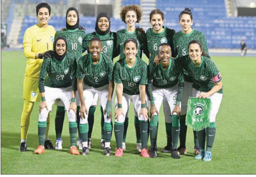
منتخب السعودية للسيدات سيدخل هذا الشهر تصنيف «فيفا»