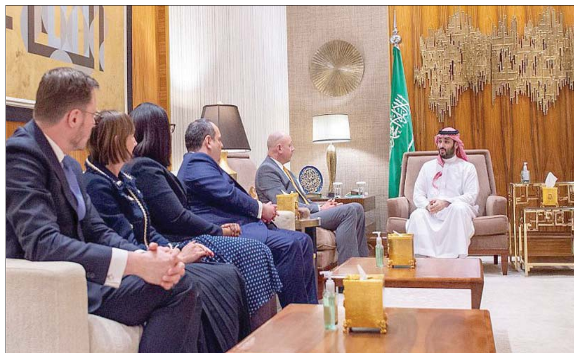
الأمير محمد بن سلمان خلال استقباله أعضاء بعثة «المكتب الدولي للمعارض» في الرياض أمس

وكجزء من مرحلة تقييم ملفات الترشيح للفرز باستضافة معرض إكسبو الدولي 2030، تعمل بعثة المكتب الدولي للمعارض على مناقشة جداول ملفات الترشيح المقدمة من الدول المتنافسة؛ حيث يتضمن التقييم الذي يُعد خطوة ضرورية للنظر في ملفات ترشيح الدول المتنافسة، النظر في دوافع الترشيح لكل مدينة متنافسة، ومدى قيمة وجاذبية موضوع المعرض المقترح، والأطلاع على الموقع المقرر لإقامة المعرض، وكيفية إعادة استخدامه بعد انتهاء فترة إقامة المعرض، بالإضافة إلى حجم الدعم المحلي والحكومي للمشروع، والمشاركة المتوقعة وخطة الجدوى المالية.