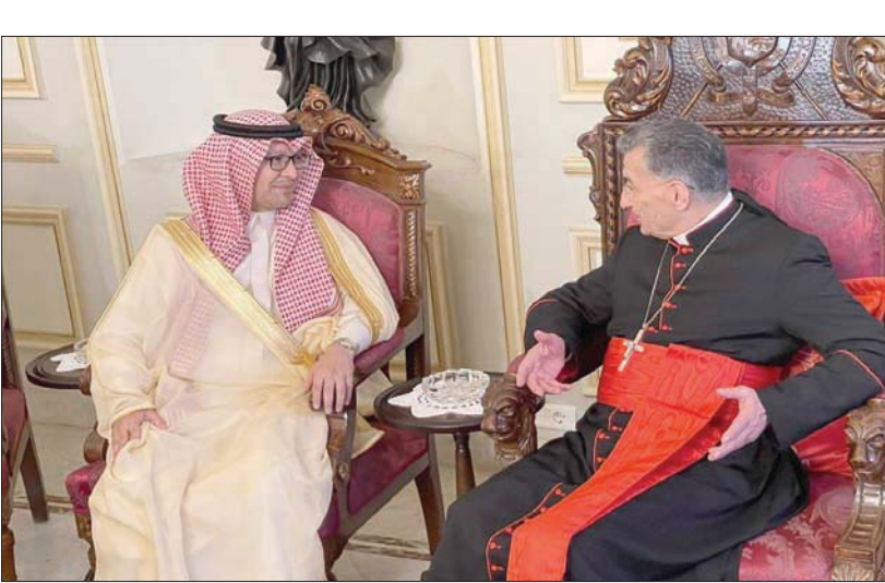
الطيريك الراعي مستقبلاً السفير بخاري أمس

غياض، ردأ على أسئلة الإعلاميين: «السفير بخاري وضع البطيريك في أجواء لقاء باريس، كما أكد دعم لبنان للخروج من الأزمة، والتزامه بدعم خريطة الإنقاذ».