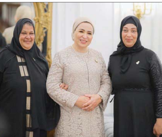
السيدة الأولى انتصار السيسي مع المكرمات في اليوم العالمي للمرأة

التغيير المناخي مع مراعاة تمكين المرأة، فكان ذلك من خلال الحملات التوعوية للنساء بالأساليب الزراعية الصديقة للبيئة، ومبادرات تعريفها بأساليب الحد من الانبعاثات غازات الاحتباس الحراري. وارتكز الطرح الدولي لرؤية مصر للمرأة والبيئة وتغير المناخ على 7 ركائز، وكان أبرزها: إشراك المرأة في مراحل الحوكمة البيئية، والتوعية وإنتاج السلوكي، وتعزيز إنتاج البيانات ذات الصلة بقضايا المرأة، وغيرها. ولفت المجلس إلى أنه تم تمكين أكثر من 3 آلاف رائدة أعمال، (3188 رائدة أعمال)، في مجال التربية الحيوانية. واستعرض كذلك