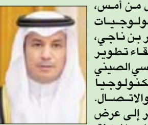
نواف بن سعيد المالكي