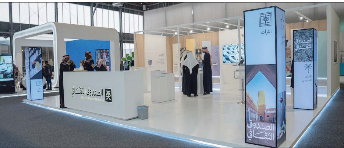
كشفت الاستراتيجية التي ربطت بين وزارتي الثقافة والاستثمار عن استراتيجية شاملة لتنمية الاستثمار الثقافي

الثقافية، من تمويل وتحفيز إطلاق عدد من المشروعات ذات الطابع الثقافي، بميزانية تبلغ 181 مليون ريال، لتمكينها من بدء أعمالها أو دعم توسعها، وتحسين جودة خدماتها ومخرجاتها.