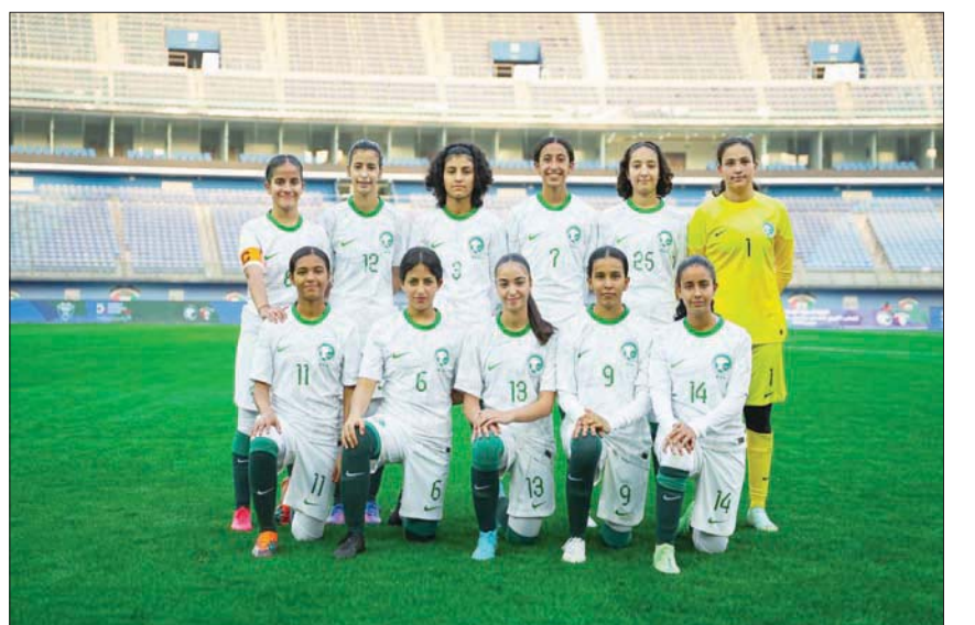
منتخب السعودية للنشائات في أول ظهور له هذا العام

للإعبات 694 لاعبة حتى يومنا هذا، وهذا الرقم يشكل زيادة هائلة بنسبة 83 في المائة بالمقارنة مع عدد اللاعبات