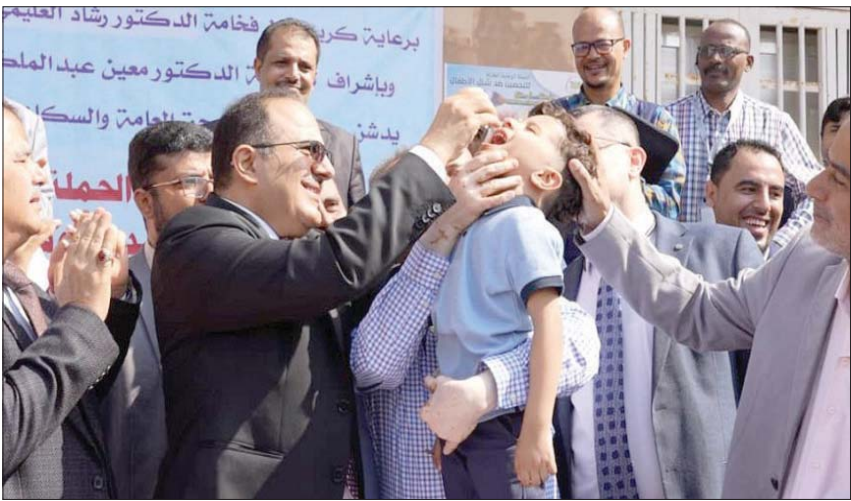
وزير الصحة اليمني يدشن في عدن حملة اللقاح ضد شلل الأطفال

تواجه الحكومة اليمنية عودة فيروس شلل الأطفال، الناتجة عن الحرب الحوثية على اللقاحات، بحملة تحصين شاملة بالتعاون مع منظمة الأمم المتحدة للطفولة (اليونيسف) والصحة العالمية، في حين بدأ انتشار الفيروس داخل اليمن يلقي بظلاله على سمعة اليمن، ويهدد بتحويلها إلى بؤرة لانتشار الأوبئة، ومؤخراً اشترطت السلطات المصرية حصول الأطفال مليون وربع المليون طفل دون سن 5 سنوات في اثنتي عشرة محافظة، بينما أبدت أوساط عالمية مخاوفها من عودة تقيي وباء شلل الأطفال، بعد الإعلان عن تسجيل 227 حالة إصابة بالمرض منذ 2021، غالبيتها في مناطق سيطرة الانقلابيين الحوثيين.