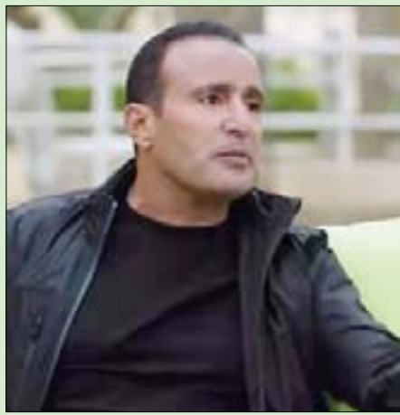
أحمد السقا