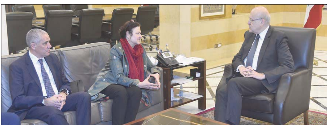
رئيس الوزراء اللبناني نجيب ميقاتي مجتمعاً مع المسؤولة الأوروبية مازنونفا أمس

بيروت، الشرق الأوسط أعلنت نائبة المدير العام والمسؤولة عن سياسة الجوار مع الشرق في المفوضية الأوروبية والمسؤولة عن تنمية القطاع الخاص كاترينا مازنونفا بعد لقائها أمس رئيس حكومة تصريف الأعمال اللبنانية نجيب ميقاتي، أن البحث تناول الخطوات المطلوبة لإطلاق اتفاق مع صندوق النقد الدولي. واستقبل ميقاتي أمس مازنونفا أمس ومعها سفير الاتحاد الأوروبي في بيروت والف طرف يرافقهما وفد ضم