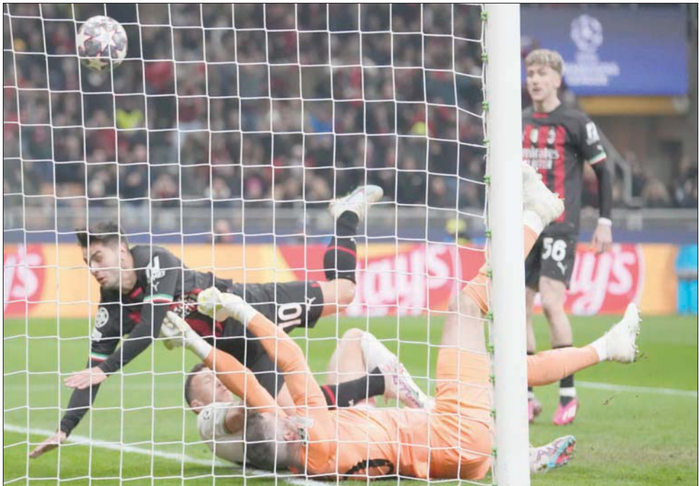
براهيم دياز لاعب ميلان (يسار) يسجل في مرمى توتنهام ذهاباً ليمنح فريقه الأفضلية قبل مواجهة اليوم

ويحلم مبابي، هدف مونديال قطر، بمنح سان جيرمان لقب دوري الأبطال لأول مرة، وهو إنجاز لم يتمكن من تحقيقه سوى مرسيليا في فرنسا مطلع تسعينات القرن الماضي. لم يكن مبابي في لياقة