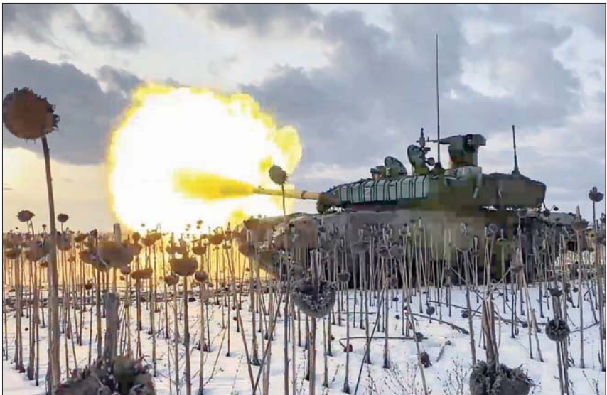
صورة وزعتها وزارة الدفاع الروسية لدبابة تي-90، تطلق النار في أوكرانيا (إبأ)

على موقع التواصل الاجتماعي «فيسبوك»: «إن القوات الروسية تكبدت أكثر من 3 آلاف دبابة، و6 آلاف مركبة مدرعة قتالية، والمئات من الأنظمة المدفعية وأنظمة إطلاق الصواريخ المتعددة، وأنظمة الدفاع الجوي والطائرات المقاتلة، والمروحيات والمركبات الآلية، إضافة إلى عديد من السفن الحربية والطائرات دون طيار ووحدات المعدات الخاصة، كما تم إسقاط نحو ألف صاروخ روسي من طراز (كروز)». وأفادت «يوكريفورم» بأن القوات الجوية الأوكرانية شنت، خلال يوم الإثنين وحده، 15 ضربة استهدفت المواقع الروسية، إضافة إلى ضربة جوية أخرى دمرت نظاماً للصواريخ المضادة للطائرات في موقعه.