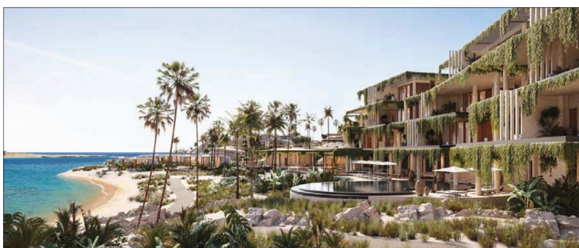
السعودية تسابق الزمن لافتتاح المنتج الصحي العالمي «أمالا» أمام الزوار والسياح العام المقبل

«أمالا» تشكل علامة فارقة، وستغير ملامح الخريطة السياحية العالمية من خلال بناء وجهة جديدة داخل المملكة، تصبح مقصدًا للزوار الأجانب من كافة بلدان العالم. وقال إن شركة «البحر الأحمر الدولية» تكثف تحركاتها لبناء شراكات مع كبرى العلامات التجارية الدولية؛ بغرض تسريع إنشاء المنتجعات الفاخرة، وبدء تشغيلها لاستقبال السياح. وتحقيق تطلعات المملكة بأن تكون مركزاً سياحياً عالمياً.