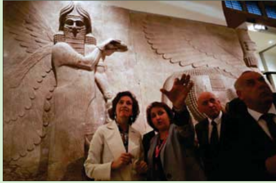
أزولاي أزولاي المديرة العامة لـ «اليونسكو» في المتحف الوطني ببغداد

أفكار تدرسها السلطات العراقية بشأن كيفية الحفاظ على هذا التراث. الفكرة هي أن نرى كيف يمكن لليونسكو أن تساعد في تسليط الضوء على هذه الحياة الثقافية وفتح المجال أمامها في مواصلة التطور. وقال المتحدث: «خلال 20 عاماً، قاموا بعمل جبار لاسترداد الآثار العراقية المبعثرة». وتزور أزولاي اليوم الموصل لتفقد ورش تاهيل مواقع أثرية تقوم بها مؤسساتها في هذه المدينة الكبيرة بشمال العراق، التي كانت معقلاً لتنظيم «داعش» قبل هزيمته في عام 2017 ولحق بها دمار كبير إثر معارك ضارية. ونشطت المسؤولية الأربعة، في أربيل عاصمة إقليم كردستان المتمتع بحكم ذاتي، حيث تقع قلعة أربيل الأثرية المصنفة ضمن التراث العالمي.