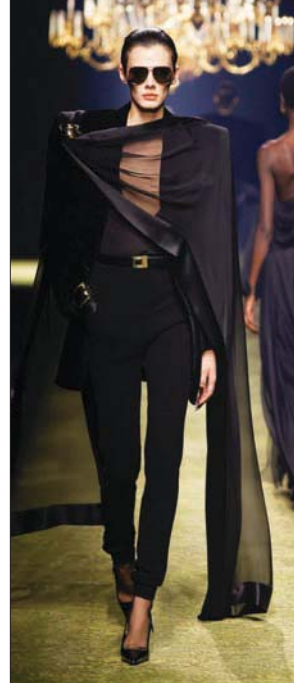
تايورات باكتاف حادة مع بتنولات ضيقة وإيشاريات (الصور من سان لوران)