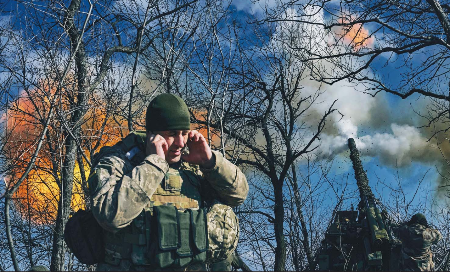
جنود أوكرانيون يطلقون قذائف باتجاه القوات الروسية قرب باخموت

بعدما دوت صفارات الإنذار لساعات في كييف، وقال سلاح الجو على تطبيق «تلغرام» إن القوات الروسية أطلقت 15 طائرة إيرانية الصنع من طراز «شاهد» من منطقة بريانسك شمال شرقي كييف، أسقطت القوات الأوكرانية 13 منها. ودوت صفارات الإنذار في كييف لساعات في وقت مبكر أمس الإثنين محذرة من غارات جوية، وقالت السلطات إنه تم تفعيل الدفاعات الجوية جراء «هدف جوي». وقال مسؤول الإدارة العسكرية سيرغي بوينكو إن المسيرات كانت في طريقها إلى كييف، لكن الدفاعات الجوية الأوكرانية أسقطتها، ولم تتسبب إصابات بشرية أو تطول بنى تحتية.