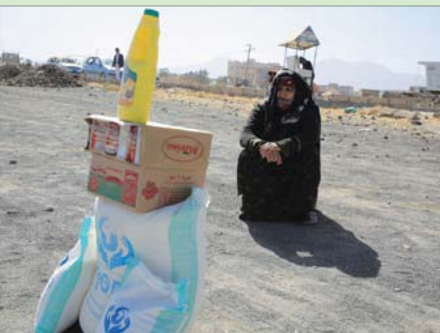
يمنية تجلس بجانب مساعدتها الغذائية وسط انعدام الأمن الغذائي في صنعاء (إ.ب.أ)

وقد كشفت مصادر طبية في صنعاء لـ«الشرق الأوسط»، أن مديري المستشفيات والمراكز الطبية، ومعهم ممثلو الشركاء المحليين للمنظمات الأممية، والمشرفون في تلك المرافق يفرضون على العاملين في القطاع الصحي منحهم جزءاً من المكافآت الشهرية، التي تصرف من قبل المنظمات الدولية، ويصل الخصم في كثير من الأحيان إلى نصف مبلغ المكافأة.