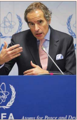
فيينا، واعدة بهتمام

غروسي خلال مؤتمر صحفي في مقر وكالة «الطاقة الذرية» في فيينا أمس