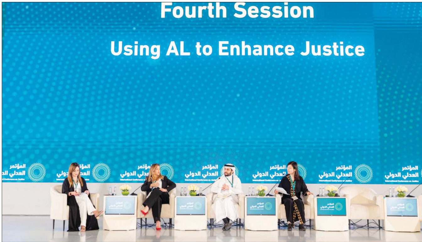
جانب من إحدى جلسات المؤتمر العدلي الدولي أمس بالرياض بحضور نخبة من الخبراء القانونيين

وأضاف المشاركون في الجلسة أن التكنولوجيا باتت جزءاً أساسياً من العملية العدلية من خلال تقديم العديد من الخدمات للمستخدمين، وأن التجربة الحالية تؤكد وجود تقدم ملموس مقارنة بما كان في الأعوام السابقة. وأفتتح الدكتور وليد الصمعياني، وزير العدل، أول من أمس (الأحد)، أعمال المؤتمر العدلي الدولي في الرياض، الذي استمر لمدة يومين، بحضور نخبة من المختصين القانونيين من مختلف أنحاء العالم، وبمشاركة أكثر من 4 آلاف مشارك، و50 متحدثاً وخبيراً دولياً.