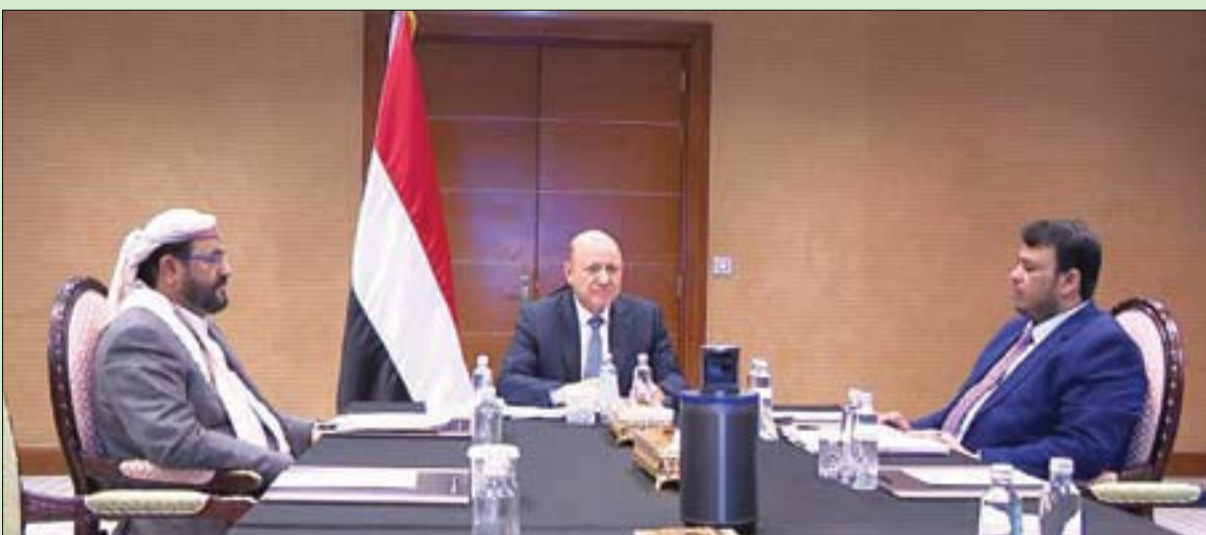
رئيس مجلس القيادة الرئاسي اليمني رشاد العليمي خلال اجتماعه بأعضاء المجلس أمس (سبأ)

وبحسب الوكالة، أقر مجلس القيادة الرئاسي جملة من الإجراءات والتوجيهات لتعزيز مسار الإصلاحات الشاملة، مع إبقاء الملف الاقتصادي والمعيشي قيد نقاشه المستمر.