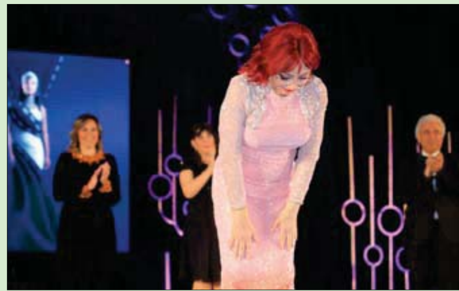
نبيلة عبيد تقدم تحية للحضور في حفل الافتتاح (إدارة مهرجان أسوان السينمائي لأفلام المرأة)