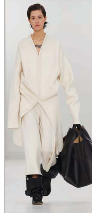
من عرض «لوي في» (لوي في)

تدمج الماضي بالحاضر، حيث تعود القصاص والتفاصيل القديمة بخلّة تُرضي ذوق الجيل الجديد». أما كيف جسّد المصمم الأمريكي هذا الأمر، فبتشكيك تلغى عليها الأحجام الكبيرة، والقصاص المفضلة مع الأكتاف البارزة والخصر الضيق، من دون أن ينسى الفستان الأسود الناعم الذي جاء بطاول مختلفة. بدورها عادت بنا المصممة ماريا غراتزيا تشيوري إلى الخمسينات؛ فخرت شهدت فيها الدار مجدداً وكتب فيها المؤسس كريستيان ديور قصلاً مثيراً أعاد فيه للمرأة أنوثتها التي سرقتها منها سنوات الحرب العالمية الثانية وما ترتب عليها من سُخج الموارد، الأمر الذي اضطرها لاستعمال أقمشة رجالية خشنة وتنورات مستقيمة. الالفت أن تشكيك ماريا غراتزيا، هذه المرة، كانت بمثابة احتفال بأسلوب المؤسس الرومانسي وثورة عليه في الوقت نفسه. لم تستعمل مثله أمتاراً وفيرة من الأقمشة كما فعل هو لإخراج المرأة من حالة التقشف التي فرضتها عليها الحرب، ولا أكثر من المولدين والحريز والتافتا وغيرها من الأقمشة بشكّلها ولمسها الناعم، ولا حتى عادت إلينا تصميم الكريول بتنورتته المستديرة، فهذه اقتصرت على