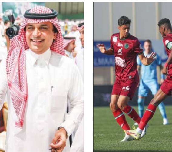
فريق الاتفاق يحتل المرتبة العاشرة في ترتيب الدوري السعودي

وأضاف: «الكابوس الأكبر للاتفاقين أن تحصل انتخابات كما حصل في السنوات الماضية، وتحديداً في عام 2015، وهي التي شقت الصف بشكل شاسع، ومن المهم أن يكون ما حصل درساً يجب