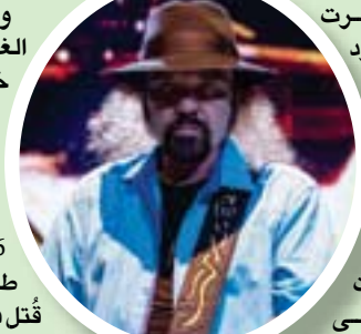
فرقة «اللينيرد سكاينيرد»