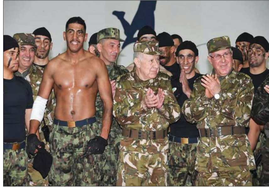
قائد الجيش الجزائري مع فرقة من جنوده

للمقاربات الحكيمة التي لطما تمنحتها الدولة الجزائرية منذ استقلالها تجاه القضايا العادلة في القارة وفي العالم، ووقوفها الدائم إلى جانب حق الشعوب في تقرير مصيرها.» وأضاف أن بلاده «وقفت إلى جانب البلدان الأفريقية، لا سيما عبر مرافقتها في تسوية أوضاعها الأمنية، من خلال تفضيل الحلول الداخلية واحترام سيادة الدول ورفض التدخل في شؤونها الداخلية، فضلاً عن تقديم المساعدات في مختلف المجالات، العسكرية والاقتصادية والإنسانية.» كما أثنى على مبادرة تبون منح مليار دولار لقيادة خطط التنمية في أفريقيا «لأنه لا يمكن للأمن والسلام أن يتحققا في أفريقيا دون تنمية فعالة.» وفي سياق ذي صلة، بحثت جينكزن مع مسؤولين جزائريين «الأوضاع الأمنية بمالي وليبيا وخطر تهريب السلاح، وتجارة المخدرات والتي تتسبب في تهديد الأمن البشري بالحدود، والتي نقلت من رقابة الحكومات بهذه المناطق، التي كما تساهم في التنمية المستدامة لدول الجوار»، مشيداً بـ«المساعي الحثيثة التي يقوم بها رئيس الجمهورية (عبد المجيد تبون) في مجال تعزيز دور الجزائر الإقليمي، والحفاظ على مكانتها المرموقة على الساحة الأفريقية، التي تتجلى بالاحترام الذي تحظى به لدى معظم دول القارة وشعوبها، وذلك بالنظر