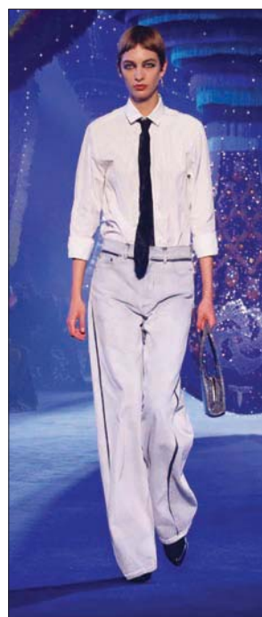
أول إطلالة: تنورة مستقيمة وقميص مكرمش وربطة عنق