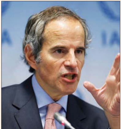
غروسي في فيينا أمس

قال المدير العام للوكالة الدولية للطاقة الذرية رافاييل غروسي لمجلس المحافظين بالوكالة أمس الإثنين إنه كشف المشاورات بشأن إقامة منطقة آمنة حول محطة زابوريجيا للطاقة النووية في أوكرانيا.