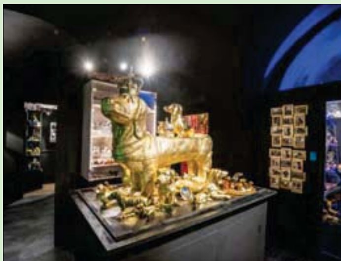
«متحف داكسهوند» في ألمانيا

ريجنسبورغ (ألمانيا) «الشرق الأوسط» 2500 إلى 5000 قطعة صغيرة وكبيرة معروضة، وذلك بعد الانتقال إلى مباني أكبر.