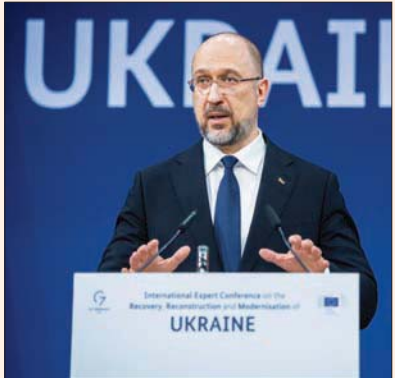
رئيس الوزراء الأوكراني دنيس شميغال (د.أ)

أعلن رئيس الوزراء الأوكراني دنيس شميغال، أمس (الإنثنين)، تعيين مدير جديد للمكتب الوطني لمكافحة الفساد، مؤكداً أن كيف نفذت بذلك الإصلاحات السبعة التي طالب بها الاتحاد الأوروبي بهدف بدء التفاوض على العضوية. وقال شميغال، في بيان: «وقت أوكرانيا الآن جميع توصيات الاتحاد الأوروبي... وهذا يوضح عزمنا على المضي قدماً في مفاوضات الانضمام في وقت مبكر مثل هذا العام».