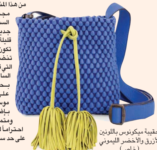
حقيبة ميكونوس باللون الأزرق والأخضر الليموني (خاص)

شجعها وتوجهت إلى باريس لتدخل هذا العالم وتجرب حظها فيه. كانت أول تجربة لها مع شركة سواروفسكي، انتقلت بعدها إلى مدريد بعد أن تلقت عرضاً مُغرياً للعمل مع دار «لوي في» الإسبانية. كانت هذ الفترة مهمة في مسيرتها، إذ تعرفت فيها على جلد النابا وتعلمت العمل بقوة.