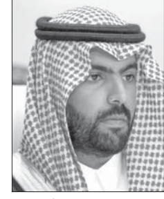
بدر بن عبد الله بن فرحان *

* وزير الثقافة رئيس اللجنة الوطنية السعودية للتربية والثقافة والعلوم