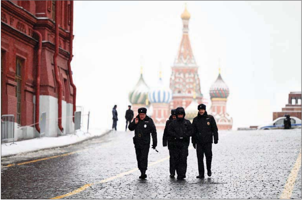
جنود روس قرب الساحة الحمراء في موسكو (أ.ب)

يحيي جميع السوريين، أنه لن يساعد بلدهم سوى أنفسهم لتجاوز جميع المشاكل التي يعانون منها، وأن يدركوا أن عودة العلاقات التركية السورية إلى وضع علاقات الجار ضرورية جداً، وبخاصة لوقف التدهور الاقتصادي في سوريا».