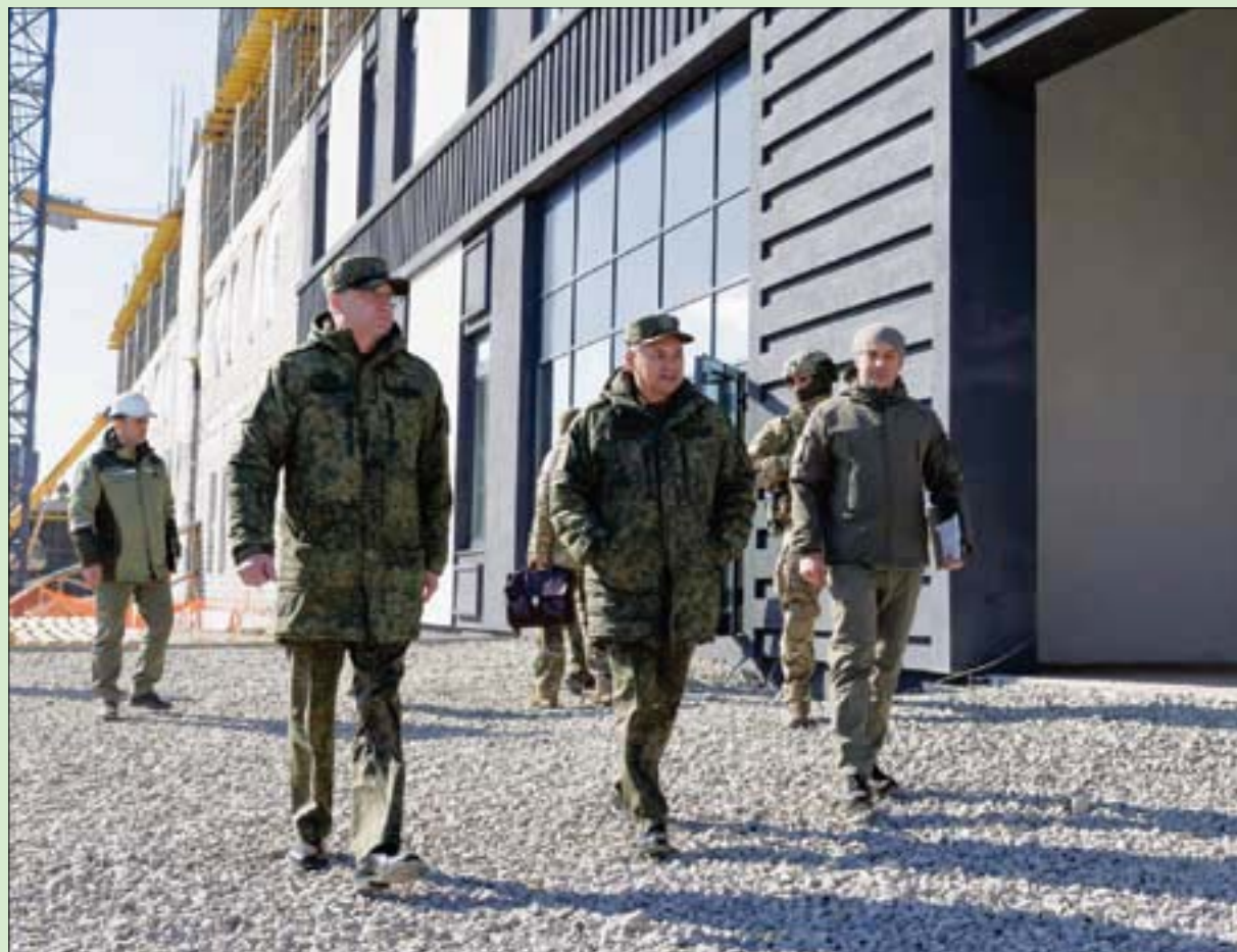
وزير الدفاع الروسي سيرغي شويغو يتفقد عمليات إعادة إعمار ماريوبول أمس

مظاهرات ليلية وإغلاق طرق وحرق إطارات في مدن عدة تصعيد شعبي ضد تعديل قانون الانتخابات العراقي بغداد، فاضل التشمي خرج مئات المحتجين في عدة محافظات وسط وجنوب العراق، مساء الأحد، في مظاهرات احتجاجية ليلية، أغلقوا خلالها شوارع رئيسية عبر حرق الإطارات، وذلك في إطار تصعيد شعبي لإرغام البرلمان على عدم إقرار تعديل قانون الانتخابات، وإعادة عمل المجالس المحلية في المحافظات. كما أصدر ناشطون بيانات غاضبة مهددة بمزيد من التصعيد خلال الأيام المقبلة، في حال أصرت القوى السياسية المهمجة في البرلمان، على تعديل القانون. وقال بيان صادر عن «اللجنة المركزية في المحافظات المنخفضة»، وهي كربلاء، والنجف، وبغداد، وبابل، والديوانية، والسماوة، وذي قار، وواسط: «ما زالت أحزاب الفساد تتجاهل مطالب الشعب ومعاناته ونداءات المرجعية الدينية تجاه إقرار قانون انتخابات منصف وعادل». وأضاف البيان أن «قوى الإطارات» (دولة القانون)، قدراً كبيراً من الإصرار على تعديل القانون، وفق ما ورد على لسان زعيم الائتلاف نوري المالكي، في حين تبدي القوى المعارضة إصراراً ممانئاً على عرقلة التعديل، ويرى البعض أن التعديل المقترح للقانون يستهدف تيار الصدر بشكل أساسي. (تفاصيل ص4)