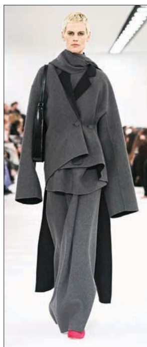
من عرض «جيفنشي»