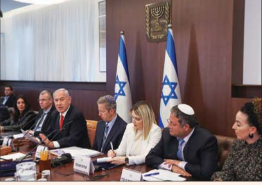
تنتابهاو يترأس الجلسة الأسبوعية للحكومة أمس... ويبدو بن غفير الثاني من اليمين

الحكومة بإقائه فوراً من منصبه، وكان الرئيس الإسرائيلي، يتسحاق هرتسوغ، قد أعلن، الاثنين، عن «تقدم كبير» في المفاوضات التي تجري خلف الكواليس، في محاولة للتوصل إلى مخطط توافقي لإصلاح جهاز القضاء الإسرائيلي، مشيراً إلى «تفاهات حول معظم الأمور». وخلال كلمته في اجتماع طارئ عقده في ديوانه بحضور نحو 100 رئيس سلطة محلية، قال هرتسوغ: «إننا أقرب من أي وقت مضى لانحلال التوصل إلى مخطط متفق عليه، وهناك تفاهمات خلف الكواليس حول معظم الأمور». ولم يكشف هرتسوغ عن طبيعة المفاوضات الجارية في الظل، ولا عن هوية المسؤولين المشاركين فيها، لكنه تحدث عن ضرورة الحد من تصاعد الخلافات العنصرية بين المسؤولين في الائتلاف الحكومي والمعارضة، لما يتسبب به من شروخ في المجتمع الإسرائيلي «تلحق ضرراً بالحصانة القضائية».