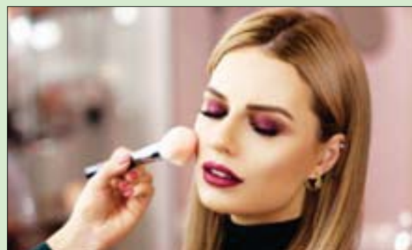
4 ساعات يستهلكها المرء يومياً لتحسين مظهره (شارتستوك)

أدوار الجنسين. ويقول دوبروف: «إن استخدام وسائل التواصل الاجتماعي هو أقوى مؤشر على السلوكيات المعززة للجاذبية، فستستخدمها الشخصون الذين يسعون جاهدين لمعايير جمال غير واقعية ويمسحون قلقي عندما تحصل صورهم على عدد أقل من الإعجابات، يستثمرون وقتاً أطول في تحسين مظهرهم أكثر من أولئك الذين يقضون وقتاً أقل أو لا يقضون وقتاً على الشبكات الاجتماعية».