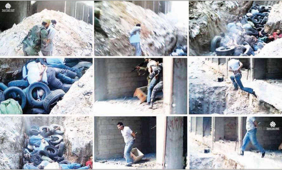
مجزرة حي التضامن (مواقع التواصل)

2022 بعد تحقيق طويل وشامل أجراه باحثون مستقلون». وقالت إن الولايات المتحدة تتخذ «إجراءات لتعزيز المساءلة عن هذه الفظائع»، معلنة فرض عقوبات على الضابط امجد يوسف بموجب «قانون التصنيف» لدى وزارة الخارجية الأميركية لعام 2023 بسبب «تورطه في انتهاكات جسيمة لحقوق الإنسان»، بما في ذلك «القتل خارج نطاق القضاء»، و«الاحتجاز التعسفي، والإخفاء القسري، والتعذيب». وأكدت أنها ستواصل دعم الجهود التي يقودها السوريون والدوليون «لضمان وجود عواقب لانتهاكات حقوق الإنسان» في سوريا، مشددة على استمرار الدعم الأميركي للسوريين الذين «يواصلون المخاطرة بحياتهم لمحاسبة نظام الأسد». وأعلنت «متابعة كل إجراء لإيجاد العدالة للضحايا والناجين من الفظائع، ولتعزيز مساءلة المسؤولين؛ بما في ذلك نظام الأسد وحلفاؤه».