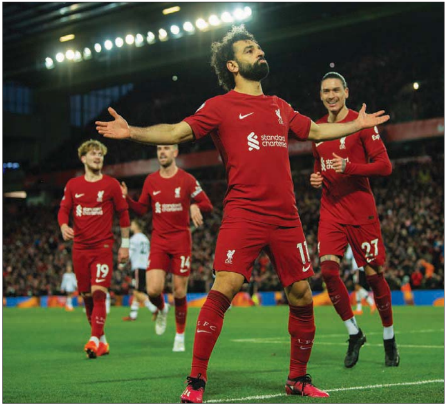
صلاح يحتفل بثنائيته في مرمى يونايتد والانفراد بالرقم القياسي لأفضل هدافي ليفربول بالدوري (إبأ)

اتجاهين معاكسين هذا الموسم، لكن هذه النظرية تحلمت إلى أجزاء صغيرة بعد انتهاء المباراة. وتمتع ليفربول بفترات تالق على حساب مانشستر يونايتد منذ قدوم المدرب كلوب إلى ملعب أنفيلد في عام 2015، إذ قاد الفريق للفوز بلقب بالدوري الإنجليزي الممتاز ودوري أبطال أوروبا وبطولتي الكاس المحليتين والمزيد من الألقاب.