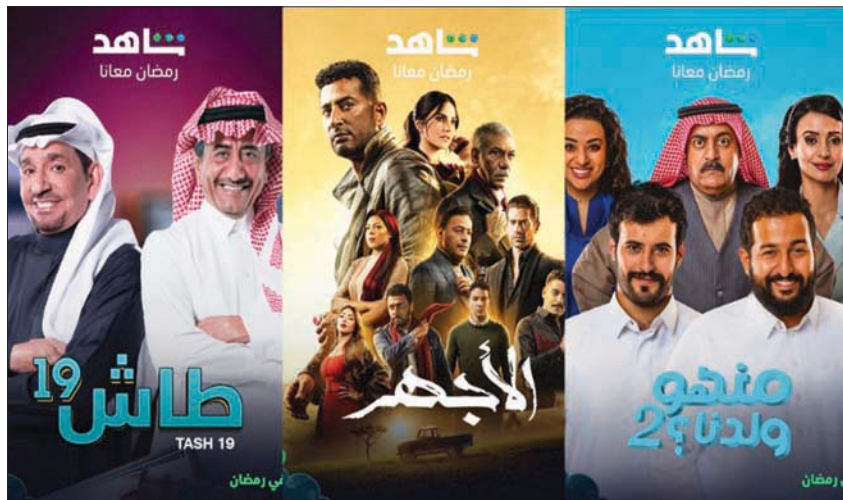
مسلسلات رمضان على منصة «شاهد»