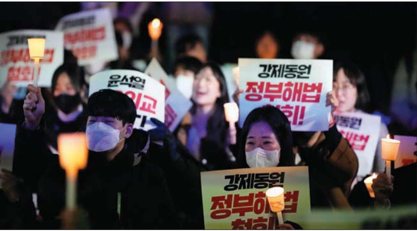
كوريون جنوبيون في مسيرة اعتراضاً على إعلان الحكومة خطتها لتعويض المواطنين من ضحايا العمل القسري خلال الحرب مع اليابان (أ.ب)

في الماضي، وتُصّر طوكيو على أن المعاهدة الموقعة في عام 1965؛ والتي سمحت للبلدين باستعادة العلاقات الدبلوماسية والحصول على تعويضات تبلغ نحو 800 مليون دولار على شكل منح وقروض رخيصة، حسمت جميع المطالب بين البلدين فيما يتعلق بالمدة الاستعمارية. وتنص خطة سيول الجديدة على أن يُعهد إلى مؤسسة محلية قبول التبرعات من الشركات الكورية الجنوبية الكبرى التي استفادت من التعويضات التي منحتها اليابان عام 1965 لتعويض الضحايا. وفي هذا الإطار، عد الوزير الكوري الجنوبي في هذا الاتفاق التجاري الأساسي لتحسين العلاقات بين طوكيو وسيول، وقال إن التعاون بين كوريا واليابان مهم للغاية في جميع مجالات الدبلوماسية والاقتصاد والأمن، في ظل الوضع الدولي الحالي الخطير والأزمة العالمية الصعبة».