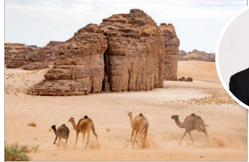
الجمال يعد رمزاً أصيلاً في العُلا مهد الحضارات والتاريخ

وأشار جونز إلى أن كأس العُلا للهجن هي قصة للتراث الثقافي الغني، لرياضة عريقة، ولتكريم الرابط الوثيق بين الهجن والعُلا، وارتقاء بسباقات الهجن إلى أفاق جديدة في القرن الواحد والعشرين، مع الحفاظ على تقديم قدر نفسه من الشغف والحماص للحضور، مثل