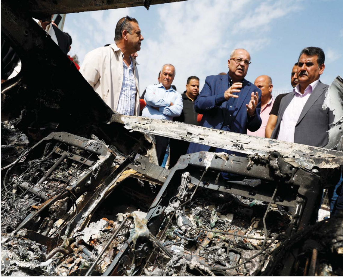
النائب العربي السابق في الكنيست أسامة السعدي يزور العائلات الفلسطينية بعد هجوم حوارة

وتعززت الشرطة الإسرائيلية نسخ هذا النموذج وتطبيقه في مدن مختلطة أخرى أيضاً، وفق ما تظهر المواد المتوفرة لدى لجنة الأمن القومي البرلمانية. وتغيباً على ذلك؛ قال الوزير بن غفير، إن «نشاط المتطوعين الذين يحرصون مدينتهم مرحب به؛ لأن هذا يستغرق إلى تعزيزات، لكن هذا يستغرق وقتاً».