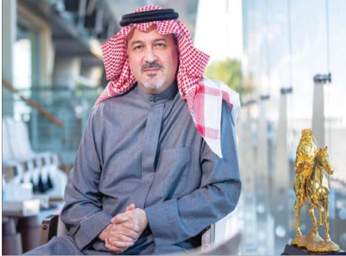
الأمير بندر بن خالد الفيصل رئيس مجلس إدارة هيئة الفروسية السعودية

على الصعيد نفسه، قال مروان العليان أمين عام هيئة الفروسية، إن «بطولة كأس المؤسس حدث كبير كما سناه ولقبه رئيس هيئة الفروسية الأمير بندر بن خالد الفيصل بـ «تاج البطولات»، وتعكس مدى