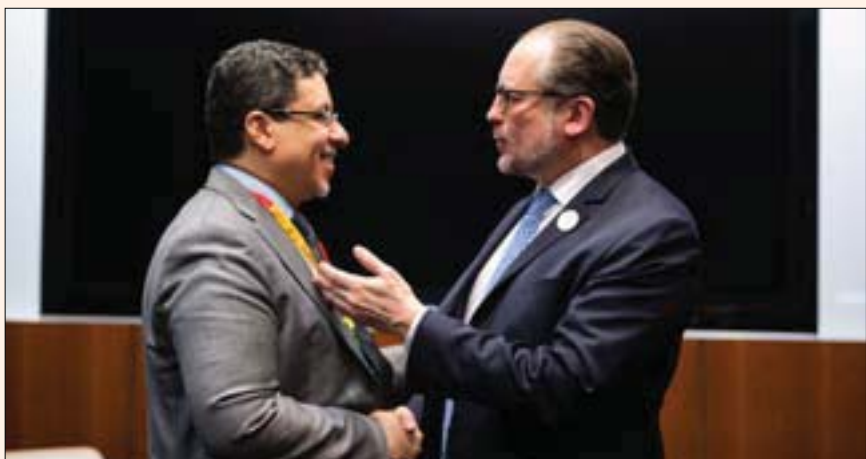
وزير الخارجية النمساوي ألكسندر شالنبيرغ يتحدث مع نظيره اليمني أحمد عوض بن مبارك على هامش المؤتمر في الدوحة

الرياض: عبد الهادي الجيتور الإيرانية التخريبية المستمرة في اليمن، متهماً إيران بـ«إرسال هدايا الموت التي تقتل شعبنا عبر البحار وعبر البر من طائرات مسيرة وصواريخ باليستية».