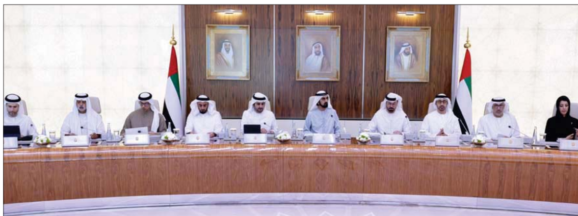
الشيخ محمد بن راشد خلال ترؤسه مجلس الوزراء الإماراتي أمس

الدولة... البنك شتبه أكثر من 57 دولة اختارت إنشاء المكتب الإقليمي في الإمارات، وأسماها البنك 100 مليار دولار، وهدفه الاستثمار في البنية التحتية لتعزيز مسيرة التنمية الاقتصادية المتسارعة». وأضاف الشيخ محمد بن راشد ال مكتوم: «واعتمدنا اليوم (أمس) في مجلس الوزراء أجندة سياسات اقتصادية دولية، واعتمدنا إنشاء مكتب للبنك الآسيوي للاستثمار في