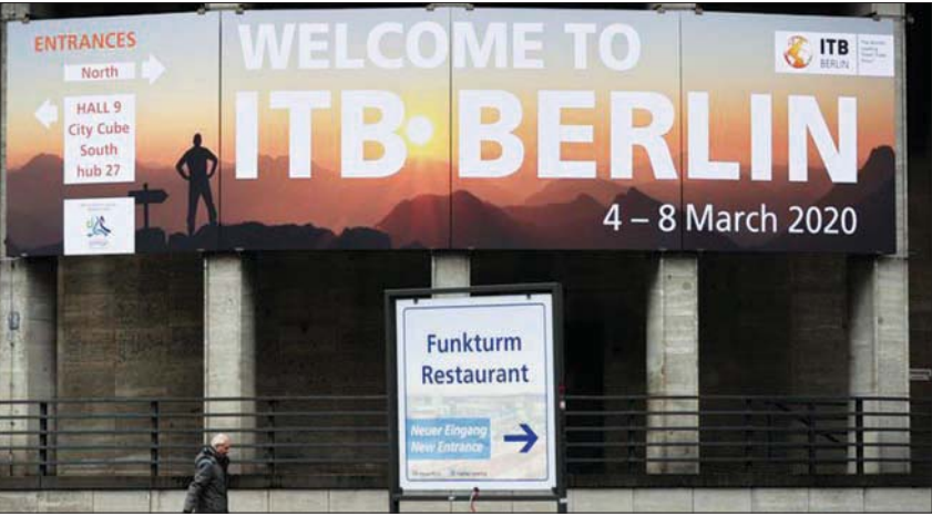
أُقيمت دورة عام 2020 والأعوام التالية لبورصة السياحة الدولية في برلين نتيجة جائحة «كورونا»

لمسافات طويلة بسبب ارتفاع معدلات التضخم أو لأسباب لها صلة بحماية المناخ وقيامهم بالتمتع بإجازاتهم داخل ألمانيا بدلاً من ذلك». وأشار ماير إلى ارتفاع الطلب من جانب السياح الأجانب مرة أخرى، وبشكل خاص فيما يتعلق بسياحة المدن، ففي العام الماضي، حسبما أوضحت الأرقام الرسمية الأولية، تراجعت الليالي السياحية للضيوف من ألمانيا والخارج بنحو 9% في فترة ما قبل «كوفيد - 19» بما يقدر إجمالاً بنحو 450,8 مليون ليلة سياحية. وإلى جانب ألمانيا، حققت فرنسا 57,9 مليار يورو في عام 2022 بفضل السياحة الدولية، وهي عائدات «قياسية» لكنها ما زالت أقل من المكاسب التي حققتها إسبانيا على هذا الصعيد، وفق ما أفادت وكالة «أوتو فرانس» المسؤولة عن الترويج للسياحة الفرنسية في الخارج.