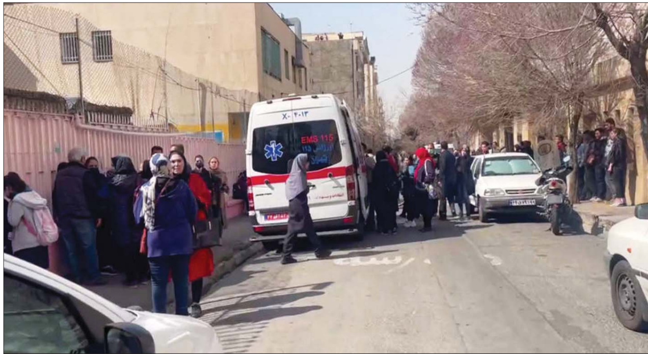
سيارة تابعة للطوارئ الإيرانية تتف أمام مدرسة تعرضت لهجوم بمواد سامة (شبكة شرق)

برلماني أكد إصابة 5 آلاف طالبة وطالب في 25 محافظة