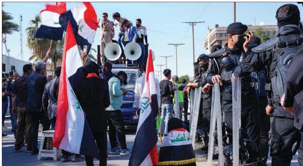
جانب من الاحتجاجات في بغداد ضد مشروع تعديل قانون الانتخابات في 27 فبراير الماضي

الشارع والاحتجاجات التي يمتلكها المعارضون. وكان الصربون والقوى المتحالفة معهم، قد نجحوا في نهاية المطاف في تعديل قانون الانتخابات وإلغاء صيغة «سانت ليغو» ذات القائمة شبه المغلقة والدائرة الواحدة، بصيغة الدوائر المتعددة والقوائم المفتوحة. ويات من المعروف أن معركة المؤيدين والرافضين لتعديل قانون الانتخابات، تدور رحاها بين قوى «الإطار التنسيقي» المصرة على التعديل بحكم هيمنتها على البرلمان من جهة، وبين التيار الصربي المنسحب من البرلمان وبعض القوى المدنية والأحزاب الصغيرة الراضية بالتعديل من جهة أخرى.