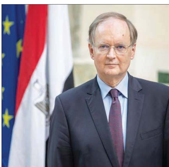
سفير الاتحاد الأوروبي لدى مصر (سفارة الاتحاد الأوروبي بالقاهرة)