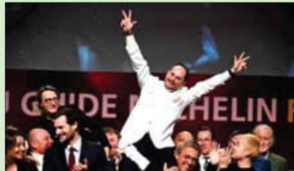
الشييف الكسندر كوبيون

في حفل فخم أقيم ظهر أمس، أعلن القائمون على دليل المطاعم «ميشلان» نتائج اختياراتهم لطبعة عام 2023. ومن بين مئات المتنافسين كان الطاهي الفرنسي الكسندر كوبيون هو الوحيد الذي نال علامة 3 نجوم، وهو التقدير الأقصى الذي يمنحه الدليل الذي يعد الأشهر من نوعه في تقديم مستويات الطاعم في العالم.