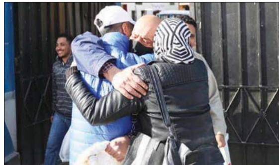
بعض من المخرج عنهم (لجنة العفو الرئاسي)

مختلفة. وأكد الخولي، (الاثنين)، أن «اللجنة تتوجه بالتحية والتقدير للنيابة العامة المصرية، ووزارة الداخلية المصرية على جهودهما المبذولة في هذا الملف، كما تتوجه اللجنة بالشكر إلى القوى السياسية والحزبية التي تتعاون مع اللجنة وتُسهم في إنجاح عملها»، وأضاف أن اللجنة «ستستمر في عملها»، ومتطلعة لـ«مزيد من النجاحات في هذا الملف». وتؤكد لجنة «العفو الرئاسي»، «رفضها خروج أي سجين يمثل تهديداً»، وقال الخولي في تصريحات سابقة إن اللجنة «لن تكون سبباً في خروج أي شخص يمثل تهديداً أو مساساً بحياة المصريين»، مضيفاً في تصريحات سابقة أن «هناك معيارين لعمل