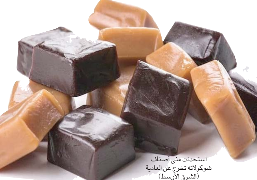
استحدثت منى أصناف شوكولاته تخرج عن العادية

تنتهي. فالشوكولاته الموزعة على الرفوف، وفي أوان خاصة تدعوك إلى تذوقها من دون استئذان، «أحب هذا الشعور عند زبائني عندما يختارون أي نوع شوكولاته يشتررون. فهي إشارة إلى أنني أجدت اختيار الطريق