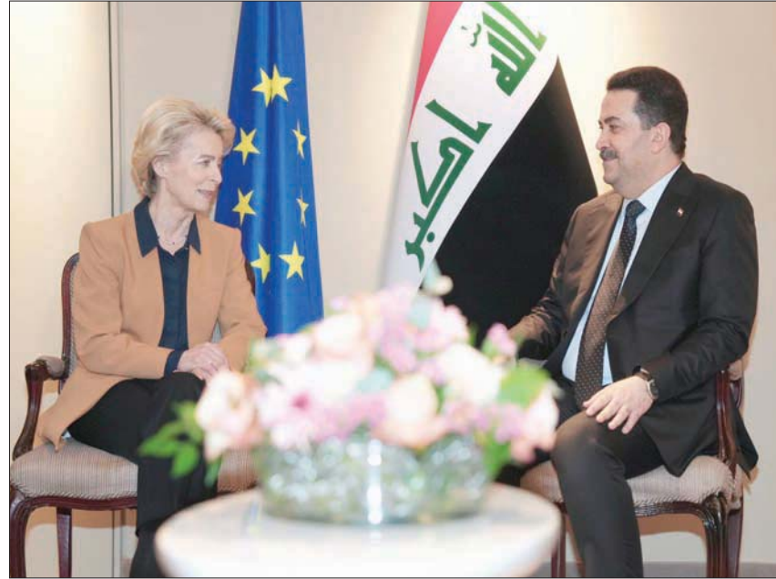
السوداني خلال لقائه رئيسة المفوضية الأوروبية أمس

وفي السياق نفسه، أكد السوداني أن الحكومة العراقية تضع هدف إقامة العلاقات المتوازنة في المقدمة، فيما أشار إلى رغبة بلاده في توطيد التعاون مع الولايات المتحدة لمحاربة الإرهاب. واستقبل السوداني أيضاً وزير الخارجية الأميركي أنتوني