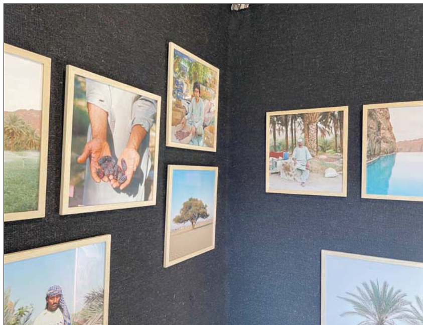
خيمة بدوية نُصبت لاحتوي معرضاً صغيراً للصور (الشرق الأوسط)