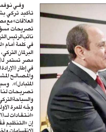
مصافحة الرئيسين المصري والتركي بحضور أمير قطر على هامش افتتاح كأس العالم نوفمبر الماضي

وفي نوفمبر الماضي، برز تأكيد تركي بشأن ملف «تطبيع العلاقات» مع مصر، وفق ما أظهرت تصريحات مسؤولين أتراك. وقال نائب الرئيس التركي، فؤاد كوكاي، في كلمة أمام «الجنة الموازنة» في البرلمان التركي، إن «اتصالنا مع مصر تستمر لـ (التطبيع العلاقات) في إطار الإرادة المشتركة للجناحين والمصالح المشتركة والاحترام المتبادل». وسبق حديث أوكطاي تصريحات لنائب وزير الثقافة والسياحة التركي، سردار جام، الذي وجه للمرة الأولى لمسؤول تركي، «انتقادات لـ (الإخوان)»، قائلاً، إن «التنظيم فقد مكانته بسبب الانقسامات واختراقه واقتراجه من (جماعات العنف)». وأضاف في نوفمبر الماضي: «الصبح الآن هناك (جماعات الإخوان)»، في (إشارة إلى انقسام التنظيم إلى ثلاث جبهات متصارعة، هي «لندن»