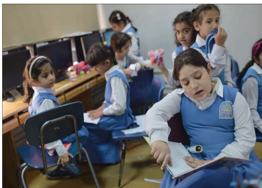
معظم الخطط التنموية استهدفت التعليم باعتباره محركاً للاقتصاد