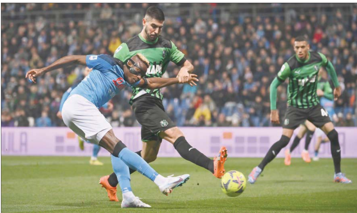
فيكتور أوسيمهن وهدف نابولي الثاني

ورفع «كفارا» الذي احتفل الأحد الماضي بعيد ميلاده الثاني والعشرين رصيده إلى 10 أهداف مع 11 تمريرة حاسمة في 19 مباراة خاضها حتى الآن في موسمه الأول في «سيرري أ» و12 مع 14 تمريرة حاسمة في 24 مباراة. ضمن جميع المسابقات. وعزز أوسيمهن صدارته لترتيب الهادفين بهدفه الثامن عشر في 19 مباراة. وهو الفوز 20 لنابولي هذا الموسم والسابع على التوالي منذ خسارته الوحيدة هذا الموسم أمام إنتر صفر-1 في المرحلة السادسة عشر، فعزز صدارته برصيد 62 نقطة. ويقدم النادي الجنوبي أداء رائعاً هذا الموسم في سعيه المستمر للفوز بلقبه الثالث في «سيرري أ» والأول منذ العام 1990 حين قاده الراحل الأسطورة الأرجنتيني دييغو أرماندو مارادونا إلى لقبه الثاني في تاريخه بعد الأول عام 1987. واستعد أينتراخت فرانكفورت في ذهاب دور الستة عشر في مسابقة دوري أبطال أوروبا. في المقابل توقفت صعوة ساسولو في الآونة الأخيرة ومضى بخسارته الأولى في مبارياته الخمس الأخيرة بعد انتصارين متوالياً على ميلان وئاتلانتا برغامو وتعادلين