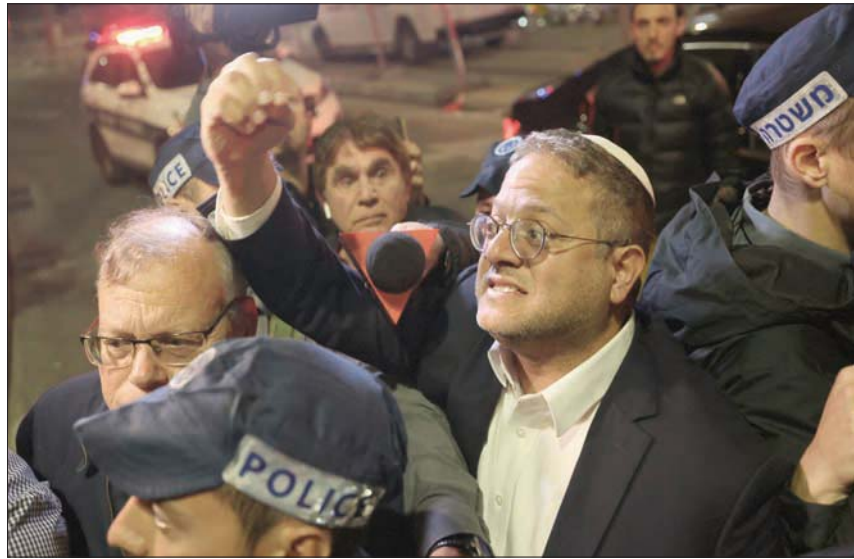
بن غفير يتحدث بعد الهجوم على كنيس في القدس في 27 يناير الماضي

حول الاستعدادات لشهر رمضان المبارك. وحذرت الدوائر الأمنية من تصعيد محتمل في الأحياء العربية بسبب الحملة. وجاء ذلك بعدما تحدثت رئيس جهاز الأمن العام (الشاباك) ورتين بار مع بن غفير، وحذره من أن حملته القمعية في القدس الشرقية رداً على الهجمات الأخيرة، من المرجح أن تعرض على المزيد من العنف.