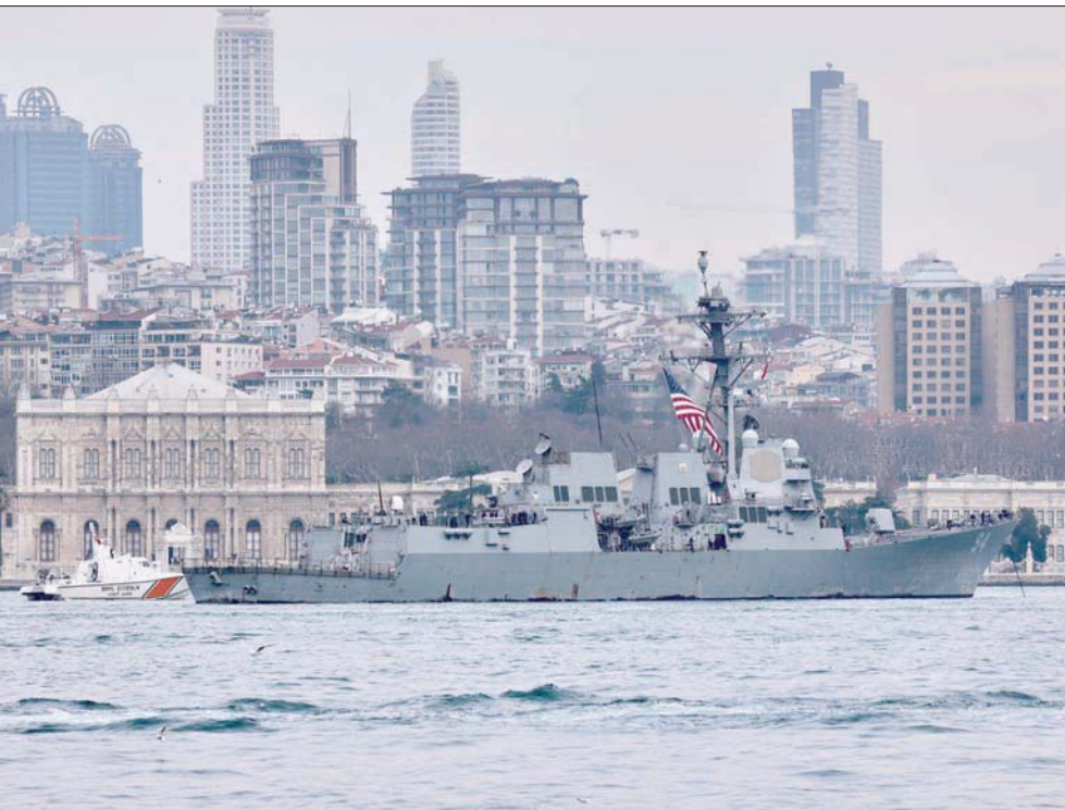
مدينة إسطنبول تعيش حالة رعب نتيجة تقارير خبراء يرجحون تعرضها لزلزال مدمر

واعتبر الدكتور ناجي غرور أن الوضع في إسطنبول ليس جيداً على الإطلاق، مطالباً بضرورة إنشاء وزارة للكوارث وتحديد ميزانية جيدة لها تمكّنها من إقامة البنية التحتية والتسنيق