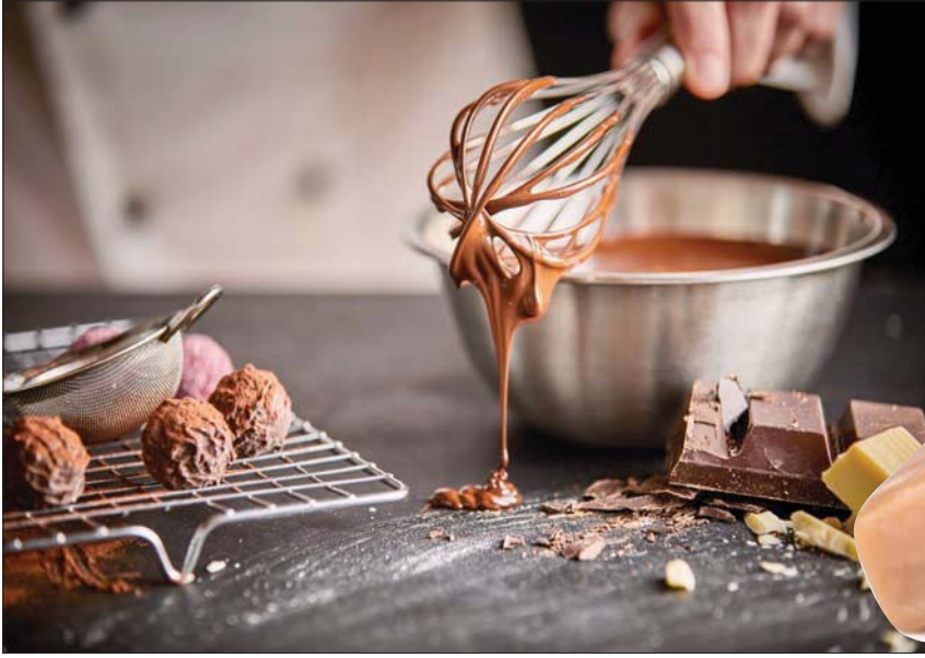
شوكولاته معجونة بالحلب (الشرق الأوسط)

نكهات بلادي وحلوياتنا المعروفة كالمغلي ولباني لبنان وقمر الدين مع الزبيب، والتمر مع جوز الهند والسحلب، فيما الثانية أردتها مقبسة عن الشوكولاته الفرنسية الشهيرة التي تقدم من دون تغليف. أما الفئة الثالثة فهي