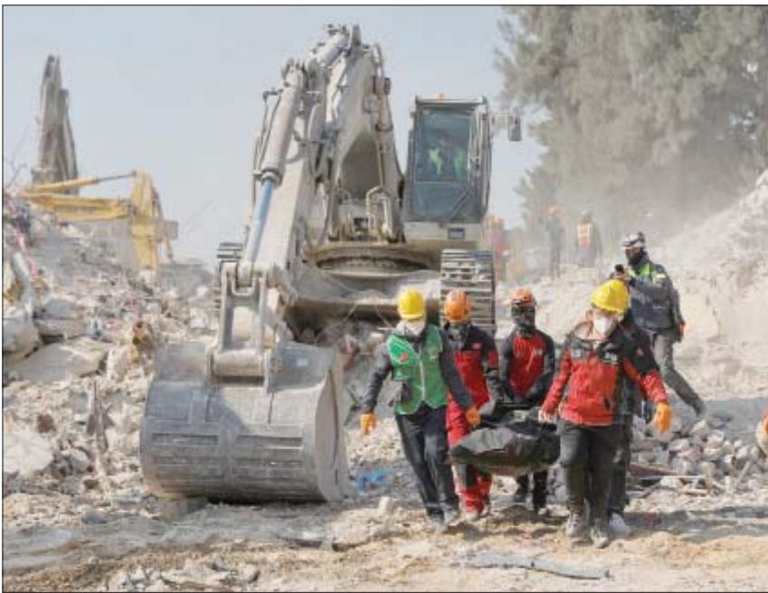
رجال الإنقاذ ينقلون جثة تم انتشالها من بين الأنقاض في أنطاكية أمس

وأضاف أنه «يمكن لمواطنينا الوصول إلى جميع المعلومات التفصيلية حول المباني المتضررة وغير المتضررة عبر موقع الحكومة الإلكتروني، ومن الممكن أن يعود المواطنون إلى المساكن غير المتضررة أو المتضررة بنسبة بسيطة، بشرط أن يقوموا بإصلاحها، بينما ستتولى الحكومة ترميم وتقوية المباني