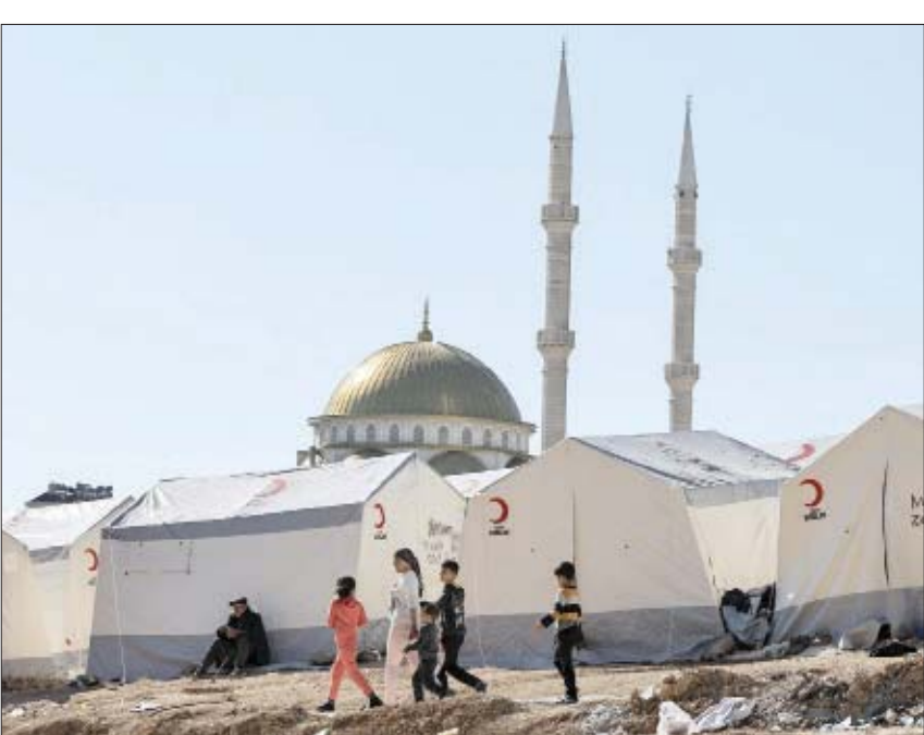
مخيم لإيواء الناجين من الزلزال في أنيامان بتركيا أمس

وأضاف غوكار أنه «تم الاتصال بالنساء الحوامل واحدة تلو الأخرى في منطقة الزلزال، وتم إعطاؤهن الأرقام التي يمكنهن الوصول إليها في حالة الطوارئ، كما قامت الفرق الطبية بإنشاء سجلات للعائلات المستودعات». وأكد «تم وضع فلاجيات صغيرة أو حاويات لنقل اللقاحات على الخيام، وتوزيع اللقاحات على جميع النقاط وعلى المستشفيات، وفي الخطوة التالية، سندد وضع حالة تحصين أطفالنا، وسقوم بتحصين الأطفال الذين قدوا مواعيد اللقاحات أو الذين حان وقتهم».