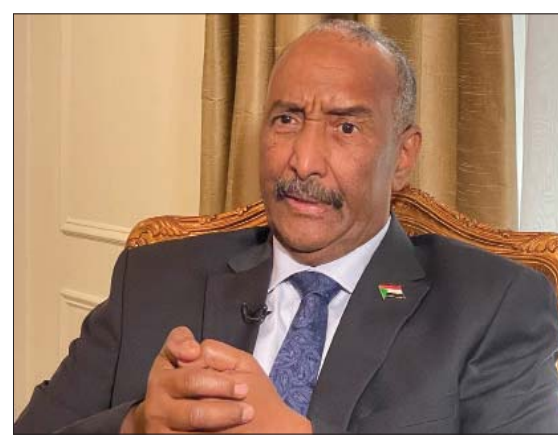
رئيس مجلس السيادة السوداني عبد الفتاح البرهان (أ ب)

أن الجيش السوداني لن ينهزم ولا يستطيع أي شخص الوقوف أمامه. وقال البرهان إن الجيش لا يوالي أي حزب أو أحد، ويحتكم للشعب السوداني، ويانتمز بامته، مؤكداً أن القوات المسلحة لن تتجزأ إلى مواجهة مع حزب أو فئة أو مجموعة. وقال: «أي حزب