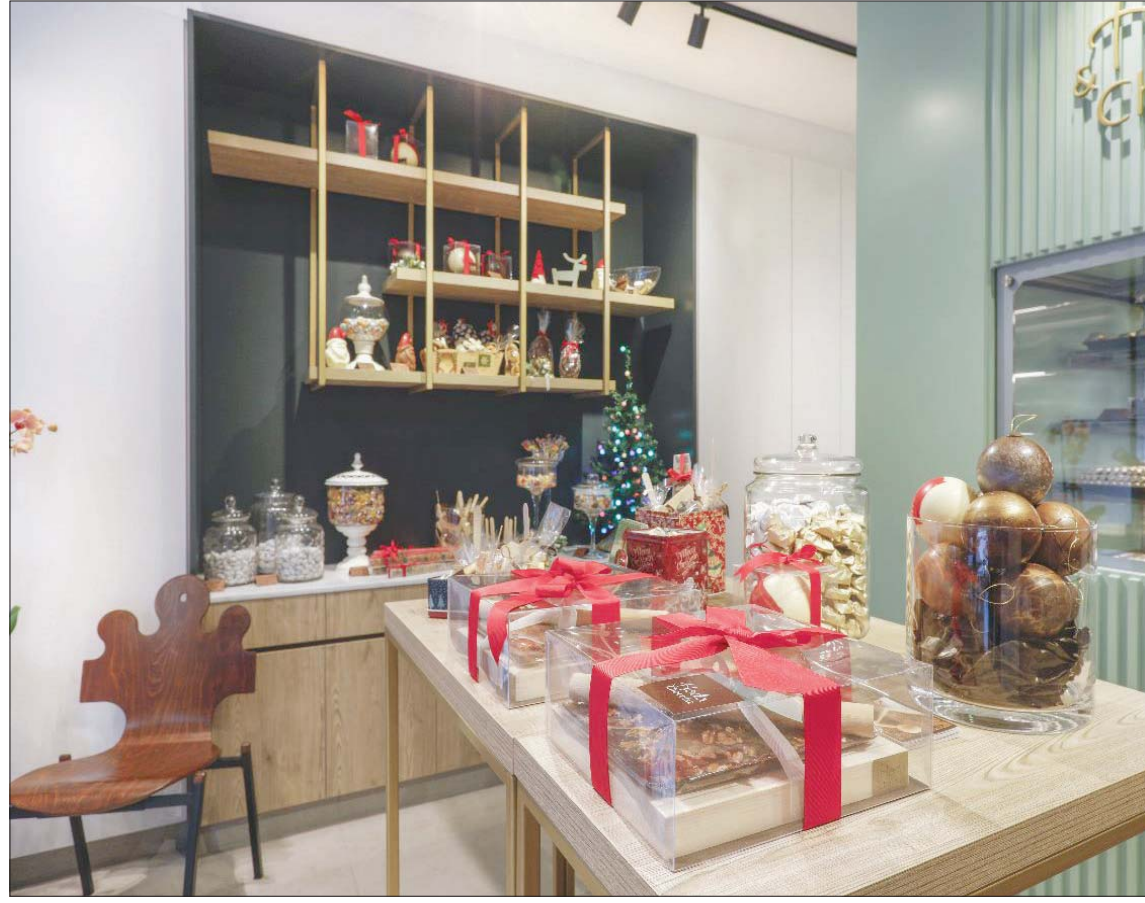
في محل «هدى والشوكولاته» باقة أنواع شوكولاته لذينة