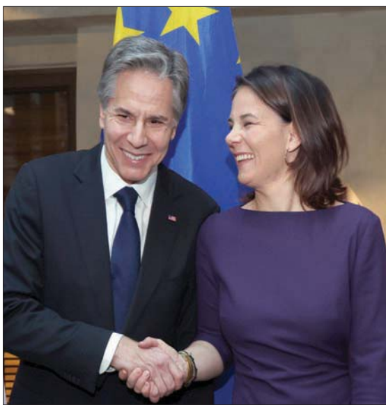
بلينكن مع نظيرته الألمانية في ميونيخ أمس

وقال المتحدث باسم «مجلس الأمن القومي الأمريكي»، جون كيربي، للصحافيين، في إفادة دورية، أول من أمس (الجمعة)، إن الولايات المتحدة تقرر أن 90 في المائة من أفراد مجموعة «فاغنر» الذين لقوا حتفهم في أوكرانيا منذ ديسمبر (كانون الأول) هم سجناء مدانون، وبحسب معلومات استخباراتية،