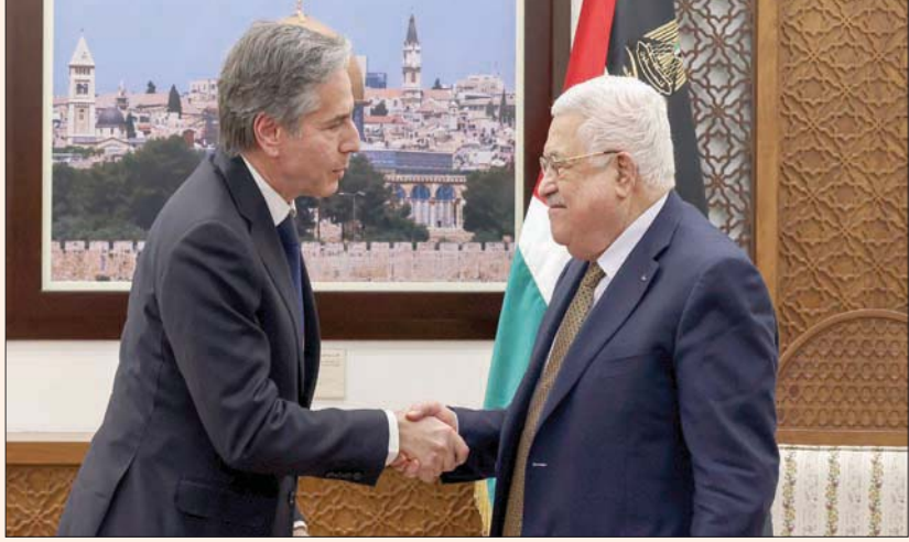
عباس ولبينكن خلال لقائهما في رام الله في 31 يناير الماضي

وقف الأعمال الأحادية. وجاء اتصال بليكن ضمن حراك مكثف بذاته الإدارة الأمريكية إلى جانب مصر والأردن، قبل نحو 3 أسابيع من أجل تهدئة الوضع في الضفة الغربية. وكانت الولايات المتحدة ومصر والأردن ضغطت من أجل كبح التوترات، والتقى بليكن ومدير «سي آي إيه» ويليام بيرنز، الرئيس الفلسطيني محمود عباس ورئيس الوزراء الإسرائيلي بنيامين نتنياهو نهاية الشهر الماضي، كما وصل إلى المنطة مدير المخابرات الأردنية اللواء أحمد حسني ومدير المخابرات المصرية اللواء عباس كامل الذي التقى كذلك رئيس المكتب السياسي لـ «حماس» إسماعيل هنية وأمين عام «الجهاد الإسلامي» زياد النخالة بمصر في وقت لاحق، ضمن الحراك الذي يستهدف استعادة الهدوء في الضفة وإبقاء قطاع غزة بعيدا عن المواجهة.