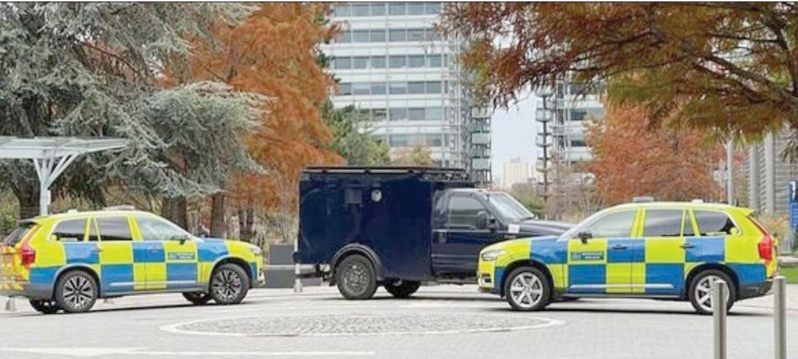
عربات للشرطة أمام مقر قناة «إيران إنترناشونال» في غرب لندن

قناة «إيران إنترناشونال»، وفي نوفمبر (تشرين الثاني) الماضي، حذرت شرطة العاصمة البريطانية من وجود تهديدات جادة وشيكة ضد حياة صحافيي القناة، ما أدى منذ ذلك الحين إلى تحصين مقر القناة في غرب لندن، ووضع تحت حراسة مسلحة من قبل الشرطة البريطانية. كما أن الشرطة البريطانية اعتقلت رجلاً يوم الاثنين الماضي واتهمته بالسعي لارتكاب جرائم إرهابية على خلفية مراقبته لمقر قناة «إيران إنترناشونال»، وتم حبسه احتياطياً إلى حين ظهوره في محكمة «أولد بيلي» بلندن يوم 3 مارس (آذار).