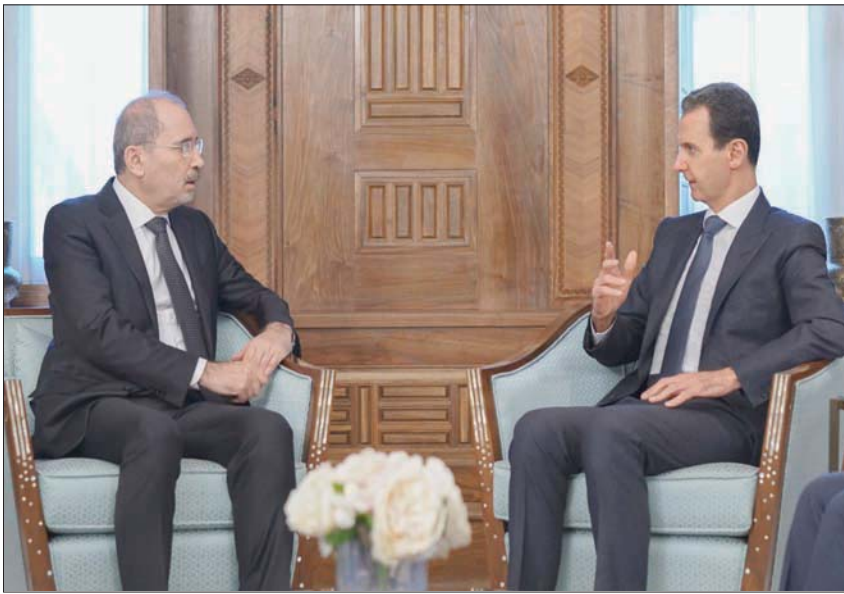
الأسد مستقبلاً وزير خارجية الأردن أيمن الصفدي في 15 الشهر الجاري (أب)

الزلزال حرك الجمود. دول عربية كانت مطبوعة أو تريد التطبيع، وجدت في الكارثة منصة لتسريع