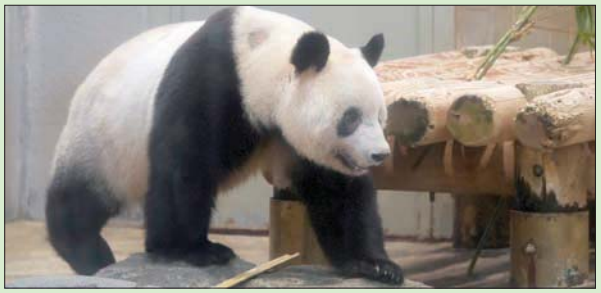
شيانغ شيانغ في طوكيو قبل عودتها للصين

طوكيو، «الشرق الأوسط» وُلدت «شيانغ شيانغ» لأم تدعى «شين شين»، وأب تدعى «ري ري»، في يونيو (حزيران) 2017، وأصبحت أول باندا عملاقة تولد في حديقة الحيوان في طوكيو. تعود إلى الصين يوم الثلاثاء المقبل. وأفادت وكالة «جي جي برس» اليابانية للأنباء، أمس (السبت)، بأن «تطبيقات اليانصيب» لآخر جلسة مشاهدة لـ«شيانغ شيانغ»، التي توافق يوم الأحد المقبل، قد أُغلقت بالفعل، وأبدى الأشخاص في المناطق القريبة من حديقة الحيوان في مقاطعة أويو بمنطقة تايوتو وارد مشاعر متباعدة بشأن الباندا العملاقة المحبوبة.