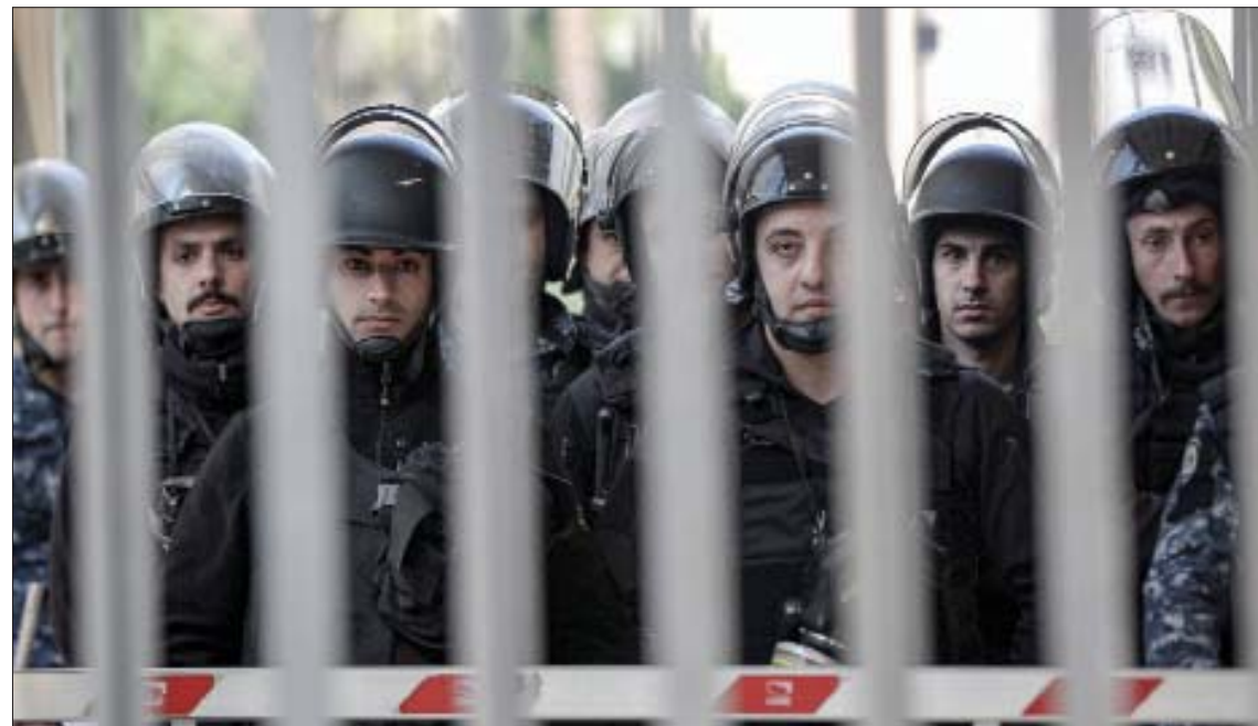
عناصر من الشرطة يقفون أمام البنك المركزي اللبناني على أهبة الاستعداد ضد محتجين على انخفاض سعر الليرة اللبنانية إلى مستويات غير مسبوق

بقائه بمنصبه أياً كان المخرج لذلك. ومن الخيارات القانونية التي يتم التدرج بها، تاجيل تسريحه كونه تابعاً للملاك الأمن العاملاً بأحكام المادة 55 من قانون الدفاع الوطني بعد استدعائه من الاحتياط إلى الخدمة الفعلية في الأمن العام». وبحسب رئيس مؤسسة «جوستيسيا» الحقوقية المحامي الدكتور بول مرقص، لم تتناول المرسومون الاشتراعيان (112 و102) اللذان يحددان السن القانونية لتسريح الموظفين العمامين والعسكريين أي أحكام تتعلق بتمديد سنّ التقاعد، مما يشير إلى ضرورة صدور تشريع قانون واحد من مجلس النواب، لافتاً إلى تصريح لـ«الشرق الأوسط» في سوابق في هذا المجال: أبرزها في عهد رئيس الجمهورية السابق إلياس الهراوي، عندما أقرّ مجلس النواب قانوناً أدى لتمديد ولاية قائد الجيش الذي كان سيحال على التقاعد، كما تبليغ المعنيين بأنه يتمسك