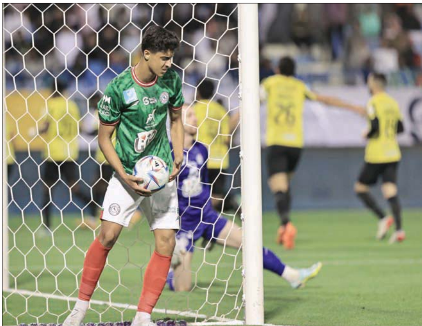
الخسارة الثامنة في الدوري أخرجت نجوم الاتفاق السابقين عن صمتهم