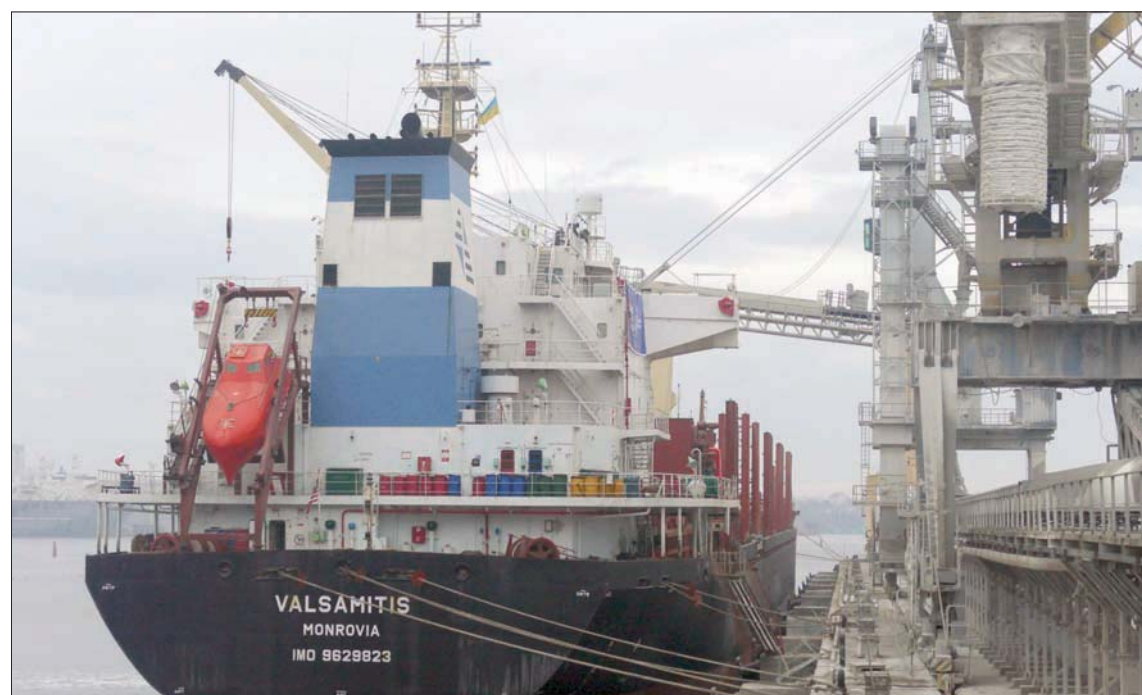
تحميل ناقلة بالقمح في ميناء تشورنومورسك على البحر الأسود أمس لتسليمها إلى كينيا وإثيوبيا في إطار مبادرة الحبوب (إبأ)

الأسوأ الذي نشهده منذ مئات السنين». في الأثناء، قال أنطونيو غوتيريش الأمين العام للأمم المتحدة أمس، إن المنظمة ستفق 250 مليون دولار من صندوق الطوارئ لمواجهة «أزمات منسية» في أنحاء العالم، بما في ذلك مساعدة المجتمعات التي تواجه خطر المجاعة في أفريقيا. وأضاف في مؤتمر صحفي على هامش القمة السنوية للاتحاد الأفريقي في إثيوبيا: «أعلن عن أكبر تخصيص على الإطلاق من الصندوق المركزي للاستجابة لحالات الطوارئ التابع للأمم المتحدة». واقتربت العقود الآجلة للقمح في بورصة شيكاغو، خلال تعاملات الأسبوع الماضي، من أعلى مستوى في ستة أسابيع مع استمرار التركيز على المخاطر التي تشكلها الحرب على إمدادات الحبوب في البحر الأسود. وبقيت أسعار الذرة ثابتة تقريبا بعد ارتفاعها مع القمح.