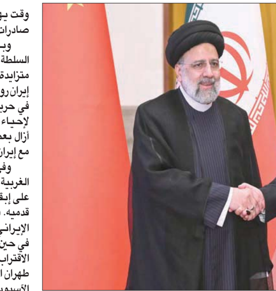
الرئيس الصيني شي جينبينغ والرئيس الإيراني إبراهيم رئيسي في 14 فبراير

الاضطرابات الداخلية التي شهدتها البلاد على مدار الشهور الخمسة الماضية، وإظهار شعور بعودة الحياة الطبيعية في الداخل والخارج». لكن جاكوب سينا، من مؤسسة «بروز اند بازار فونديشن» في لندن، قال إنه لا يتوقع أن تسفر الزيارة عن أكثر بكثير من الاعتراف بشراكة الصين مع إيران، حيث قال في تصريح لـ «سي إن إن»: «الرئيس لن يحصل على الكثير من الناحية الاقتصادية، باستثناء عدد من اتفاقيات التفاهم وبعض الصفقات الصغيرة». وقال بارسي إن إيران تذكر شعبيها أن النظر شرقاً هو الطريق الصحيح تجاه الانتعاش الاقتصادي في ظل تلاشي احتمالات العودة إلى الاتفاق النووي، وقال إن الحكومة حريصة على إظهار أن لديها «خياراً شرقياً داعماً ومربحاً»، مشيراً إلى أنه من غير المرجح أن ترتقي الصين إلى مستوى توقعات إيران.