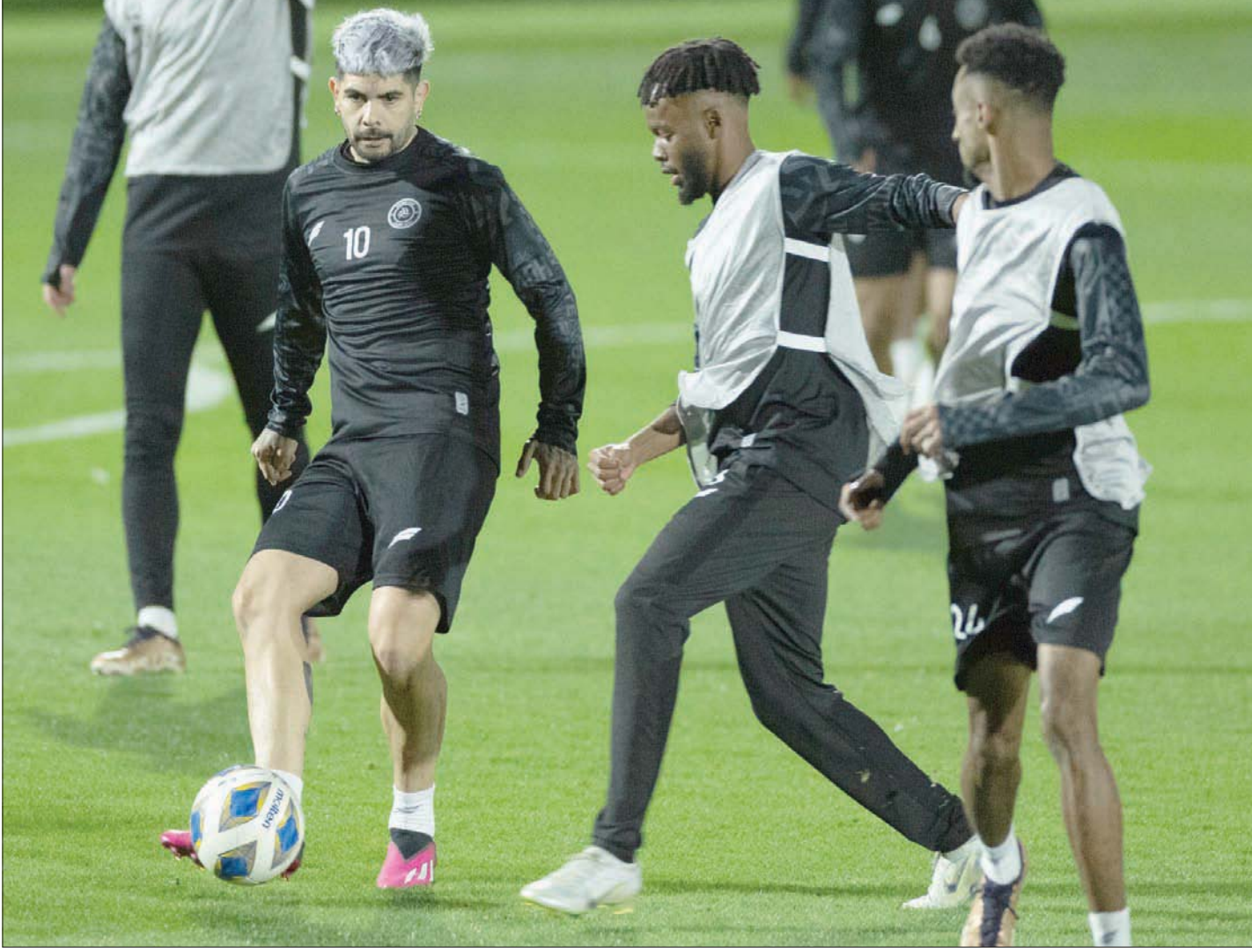
من تدريبات الشباب الأخيرة استعداداً لموقعة ناساف الأوزبكي

وهو بعيد عن خوض المباريات الرسمية، حيث لم يبدأ الدوري الأوزبكي بعد، وتأهل ناساف عن دور المجموعات بمقاعد أفضل الفرق التي احتلت المركز الثاني، بعدما حل وصيفاً لفرق الفيصل السعودي في المجموعة الخامسة برصيد 9 نقاط.