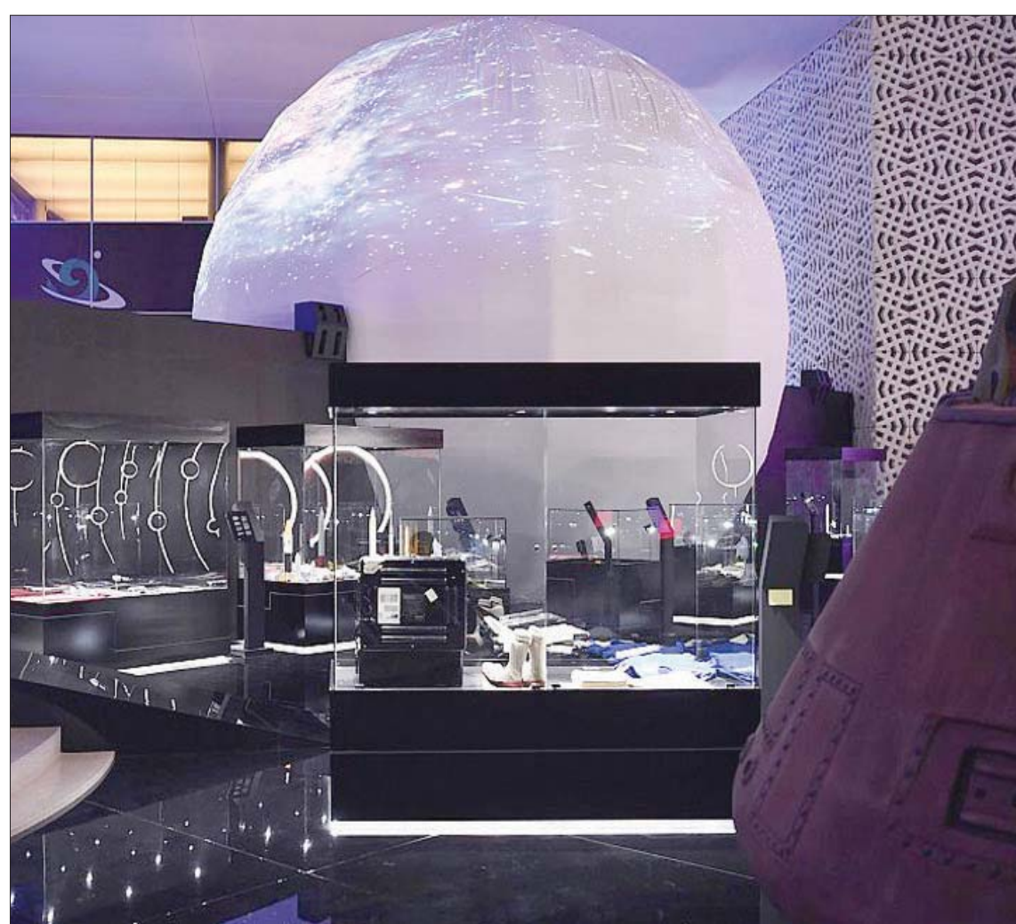
جانب من معرض الرياض للفضاء الذي عقد في واحة الملك سلمان للعلوم الشهر الماضي تحت شعار «الإنسان والفضاء»

ووفق تقرير ستانلي مورغان لعام 2018، يبلغ حجم اقتصاد الفضاء في العالم 360 مليار دولار، بينما من المتوقع أن يصل إلى 1,1 تريليون دولار في عام 2040 و2,7 تريليون دولار بحلول عام 2050. يشكل