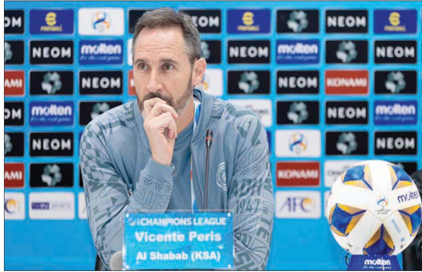
مدرب الشباب خلال المؤتمر الصحفي أمس في الدوحة

في المقابل، يعتمد التشيلي نيكولاس كوردوفا صاحب إنجاز تأهل الريان إلى ثمن النهائي القاري للمرة الأولى، على جهود الوافدين الجدد، المغربي سفيان بوفال، والتشيلي خيسون فارغاس، والمدافع الياباني شوغو تانيغوتشي، إلى جانب