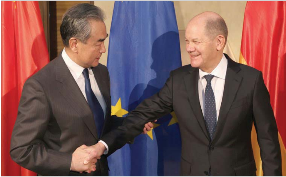
وزير الخارجية الصيني مع المستشار الألماني في ميونيخ أمس

وقال وانغ بي، وفقاً للترجمة الرسمية: «سنقدم شيئاً، إلا وهو الموقف الصيني من التسوية السياسية للأزمة الأوكرانية... سنقف بحزم إلى جانب السلام والحوار». وذكر وانغ بي أنه من أجل عالم أكثر أمناً، «يتعين أن نتمسك بمبادئ ميثاق الأمم المتحدة»، مضيفاً أن الفوضى والصراعات التي تعصف بالعالم في الوقت الحالي ثارت بسبب عدم التمسك بمبادئ ميثاق الأمم المتحدة. ودعا وانغ بي إلى حل النزاعات سلمياً من خلال الحوار والتفاوض، مؤكداً أنه لا يجوز حل المشكلات بين الدول من خلال الضغط أو العقوبات الأيديولوجية، وبوضوح أن هذا يأتي بنتائج عكسية، «لأنه يؤدي إلى صعوبات لا نهاية لها». وشدد على ضرورة عدم إهمال الحوار والتشاورات مهما كانت حدة التوترات، وقال: «يجب