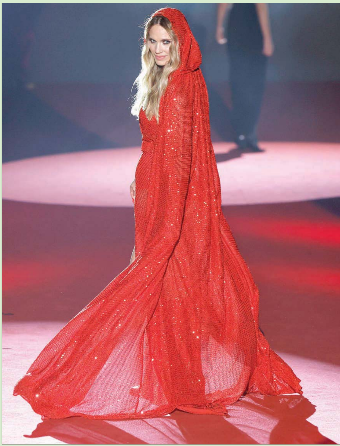
عارضة تقدم زياً خلال أسبوع أزياء الخريف والشتاء في العاصمة الإسبانية مدريد