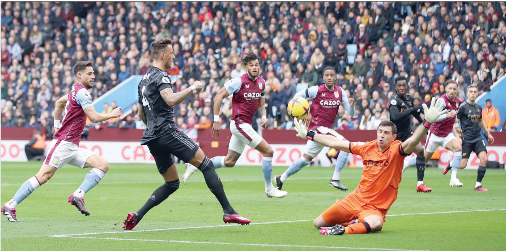
بن وايت وفرصة ضائعة من أرسنال

الجزء لكن كرتها مرت بجوار القائم الأيسر بستجماترات قليلة. واستمرت محاولات مانشستر سيتي الهجومية بحثاً عن تسجيل الهدف الثاني، وكاد كيفين دي برون أن يسجله في الدقيقة 61 عندما سدده كرة أرضية مرت بجوار القائم الأيمن. وفي الدقيقة 67 أهدر إيرلينغ هالاند فرصة تسجيل الهدف الثاني عندما سدده قبل فودين كرة قوية تصدى لها نافاس لترتد إلى هالاند الذي قابلها بتسديدة لتصطدم بالعارضة، قبل أن تعود إليه مرة أخرى، حيث سددها مرة أخرى لكنها اصطدمت بالعارضة وخرجت