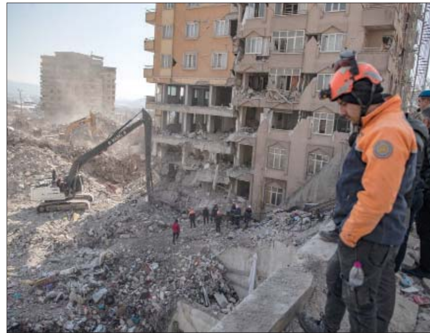
جانب من عمليات البحث عن الضحايا بين أنقاض الأبنية المدمرة في كهرمان ماراش أمس

ذات الأضرار المتوسطة». وتابع: «لا نريد أن نعيش أي الام أخرى... حذرنا المواطنين أيضاً بشأن نقل الأثاث ومحتويات المنازل، وطلبنا منهم التنسيق مع إدارة الكوارث والطوارئ... نقدم بالفعل كل الدعم اللازم لمن يريدون نقل أغراضهم من اليوم الأول عبر إدارة الكوارث والجيش والشرطة وقوات الدرك وجميع فرقنا، وسندبر عملية النقل معاً.