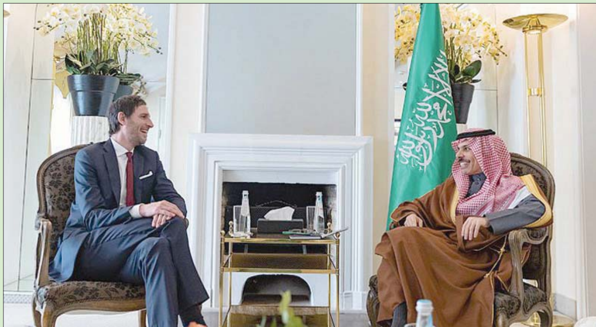
وزير الخارجية السعودي لدى لقائه نظيره الهولندي في ميونيخ

والجهود الدولية الرامية لحل الأزمة سياسياً بما يحقق الأمن والسلم الدوليين، بالإضافة إلى مناقشة عدد من القضايا والمستجدات على الساحتين الإقليمية والدولية.