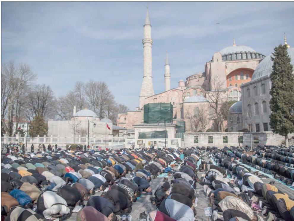
مواطنون يصلون صلاة الغائب على أرواح ضحايا الزلزال في إسطنبول أول من أمس

صعد شرق الأناضول، الذي يشهد هزات أرضية في فترات محددة. وتابع: «هناك فالق بطول 180 كيلومتراً على هذا الصعد؛ ما أسفر عن تفرغ للطاقة المحبوسة. وسيحدث تراكم للطاقة بطرفي الصعد خلال الفترات المقبلة». ورأى العضو المؤسس لأكاديمية العلوم، عالم الجيولوجيا ناجي غورور، متحدداً لـ«الشرق الأوسط»: أن الوقت ينفذ للزلزال إسطنبول المحتمل، الذي يُتوقع أن يكون بقوة 7,2 درجة كحد أدنى و7,6 درجة كحد أقصى، والذي «ستأثر به الأجزاء الساحلية من الشطر الأوروبي من المدينة أكثر من غيره».