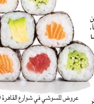
عروض للسوشي في شوارع القاهرة

خاصة للمبتدئين في تذوقه». يبلغ سعر القطعة الواحدة من السوشي على العربية 12 جنيهًا، وهو سعر موحد لأي قطعة مهما كان نوعها، أما الاختيارات فيمكن للزبون التعرف عليها عن طريق وصف البائع لكل قطعة، أو عبر الإطلاع على قائمة يضعها على عربته تصف مكونات كل نوع. ولعل أشهر الأصناف والأكثر