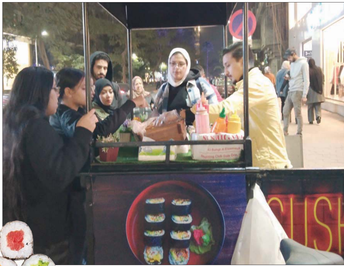
إقبال ملحوظ من المصريين على السوشي الذي يباع على العربات

وعن طريقته بالبيع، يقول: «أضع القطع التي اختارها الزبون في علبة بلاستيكية، ولها حجمان، الأولى صغيرة لسدس يختارون شراء قطعتين أو ثلث قطعتين أو