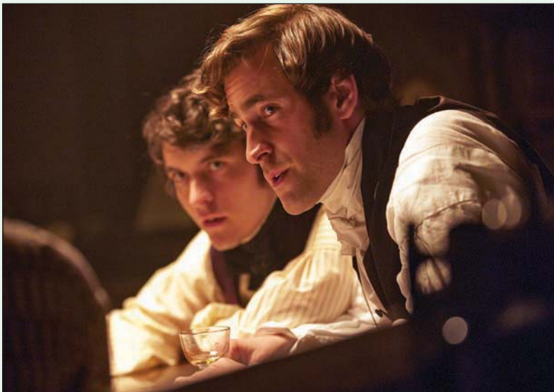
فيون وايتهد وأوليفر جاكسون كوهين في مشهد من فيلم «إيميلي»