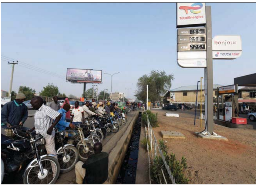
درجات نارية متراصة أمام محطات الوقود منذ الصباح في دولة منتجة للنفط وتستورد الوقود