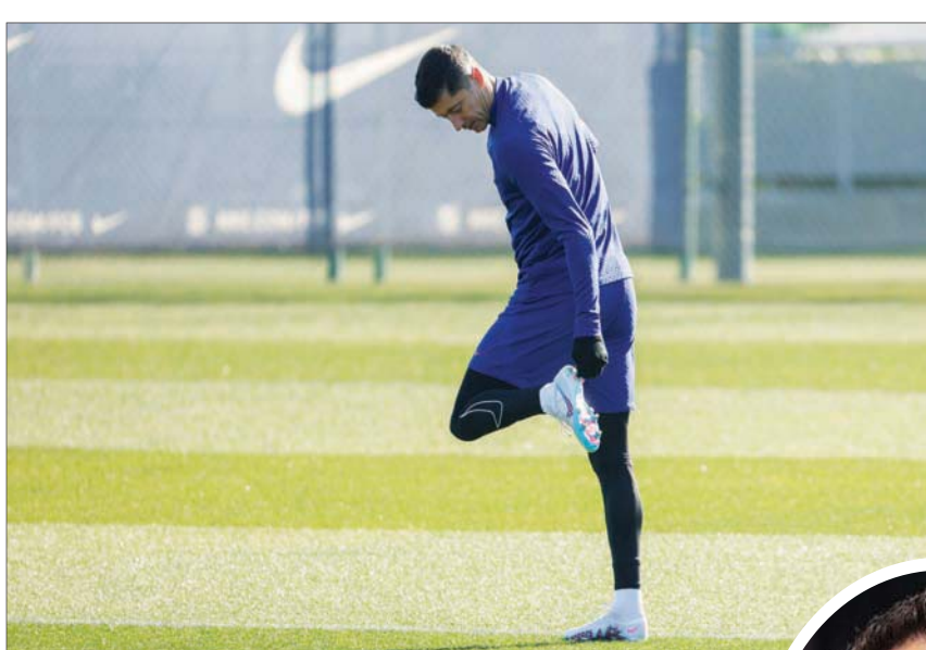
ليفاندوفسكي أضاف ثقلاً كبيراً على الهجوم الكتالوني

وللمباراة الرابعة على التوالي، في المقابل، يحلم فياريال في بتحقيق انتصاره الأول في ملعبه على منافسه الكتالوني منذ أكثر من 15 عاماً، حيث يرجع آخر انتصار له على برشلونة على هذا الملعب في 20 أكتوبر (تشرين الأول) 2007، حينما فاز (3 - 1) ببطولة الدوري. وخلال آخر 15 مباراة جرت بين الفريقين في مختلف المسابقات على ملعب «لا إسبرامিকা»، حقق برشلونة 10 انتصارات متتالية في لقاءاته، حين عزج فياريال عن تحقيق أي فوز. ولا يزال برشلونة مفتقداً