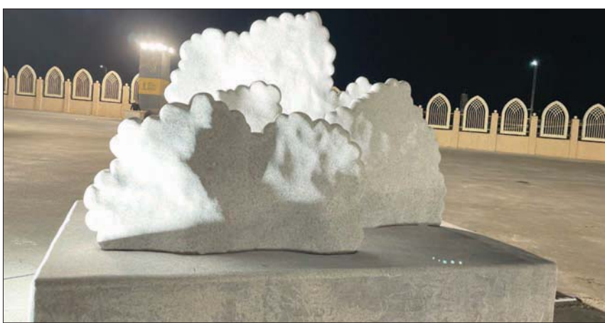
«حجارة المطر» لروب جود

الحجر يحمل إحساساً عميقاً، «عندما أعمل مع الطبيعة أحس بروحانية عالية». ورغم أنها شكلت عملها بالحجر فإنها عادة ما تعمل بالمعادن، مشيرة إلى أنها تجد متعة في تشكيلها بالنار.