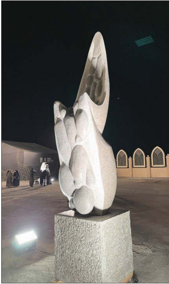
«عندما تمطر» ليناك روبرت (الشرق الأوسط)