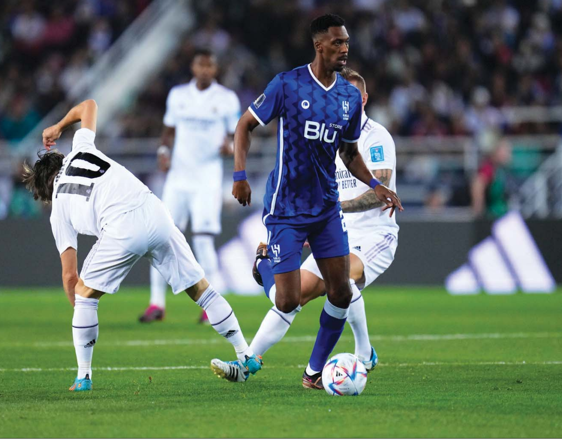
كنو متجاوزاً كروس ومودريتش في إحدى الهجمات الزرقاء.