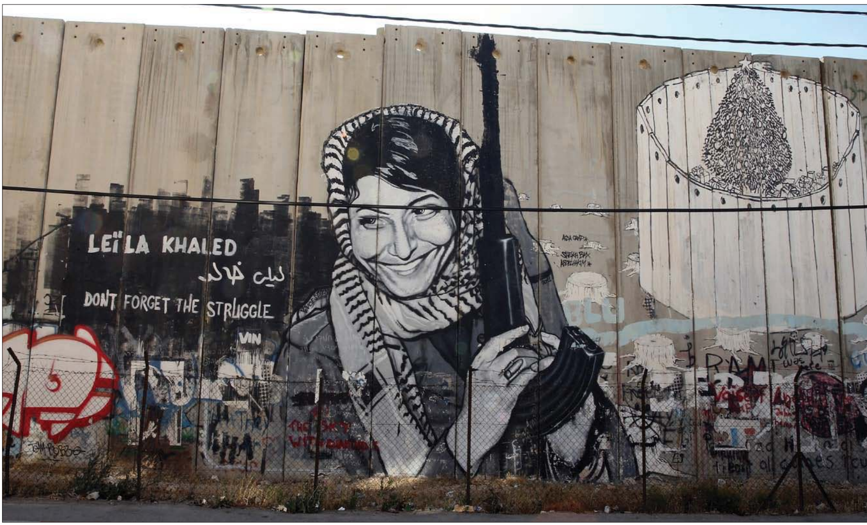
ليلى خالد على جدار الفصل الإسرائيلي في بيت لحم بالضفة الغربية

لاحظت ليلى خالد أن حداد كان بارعاً في استخدام بعض الصداقات، خصوصاً مع