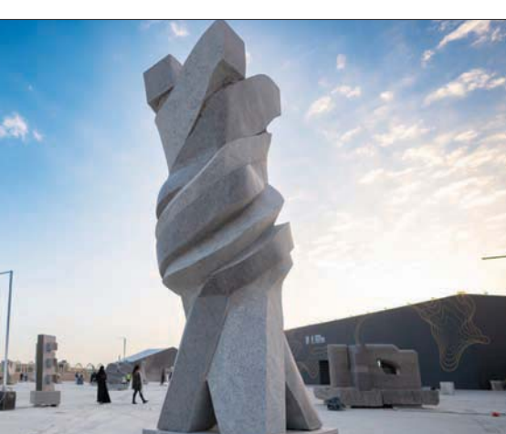
«تفاهم» لخورسيه ميلان

الفنان البلجيكي سيلفان بات اختار المزج بين حجر الرياض والغرانيت في عمله المعنون «انتشار».