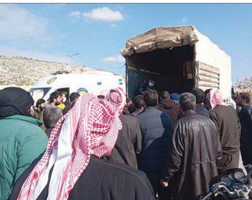
ينتظرون إنزال جثامين من شاحنة عند معبر باب الهوى