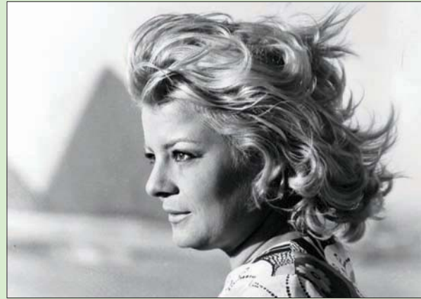
نادية لطفي بعديته في منطقة الأهرامات

فاروق إبراهيم ومساحة كبيرة في المعرض، فقد كان المصور المفضل للملازم لعدد منهم في مصر وعند السفر في الخارج، فيشاهد الزائر صوراً نادرة لكوكب الشرق أم كلثوم في منزلها، وغرفتها وهي تستعد للخروج، وكذلك الفنانة نجاة، وهي تمسك بحمامة قبل تناول الإفطار، وهند رستم مع كلابها، ونادية لطفي في منطقة الأهرامات، وفانن حمامة باناقاتها، ونزار قباني في إحدى رحلاته، ونجيب محفوظ في المهدي، أما العنديل الأسمر عبد الحليم حافظ، فقد كان إبراهيم صديقاً مقرباً له وعاش معه أدق أسراره، فضلاً عن صور لبعض الفنانين في كواليس أعمالهم، مثل صورة تحية كاريوكا في «أم العروسة»، وغير ذلك. وفيها تتداخل السياسة مع الفن مع الأبعاد الاجتماعية، كما يلتقي بمجموعة شيقية من القصص الأخير بعداً تعليمياً أعداد من مجالات احتضنت صورته عبر تاريخه، ويحمل القسم الأخير بعداً تعليمياً تثقيفياً؛ إذ يضم مجموعة من الصور تبرز قواعد التصوير وحرفيته. من أطر الصور، هي صورته وهو يقفز في الهواء، والمجموعة الخاصة بالألعاب محمد علي كلاي، حين زار مصر واصطحبه الفنان إلى الصحراء، وصوره بعد أن ضل طريقه فيها، وجاء أحد البدو لينقذه. ولنجوم الفن والثقافة مكانة خاصة في مشوار