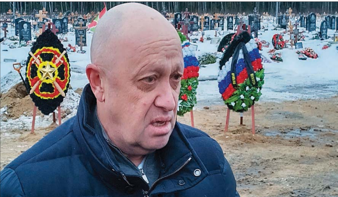
قال رئيس «فاغنر» بريغوجين إن هناك حاجة للسيطرة على باخموت «حتى تتمكن قواتنا من العمل بشكل مريح»، (أ.ب)

لا تعيش». بدوره، أنهى الرئيس الأوكراني فولوديمير زيلينسكي زيارته لأوروبا بانطباع إيجابي. وقال في رسالته المصورة مساء الجمعة: «لندن، وباريس وبروكسل، في كل مكان، تحدثت في تلك الأيام عن كيفية تعزيز قواتنا». وقال: «هناك اتفاقيات مهمة للغاية وتلقيناً إشارات جيدة». وقال إن ذلك انطباع على الدبابات والصواريخ بعيدة المدى. غير أنه أضاف أن هناك الكثير للقيام به بشأن تأمين طائرات مقاتلة لقواته في المستوى التالي من التعاون. وفي لندن، قال إنه لمس أن بريطانيا تريد حقاً أن تنصّر أوكرانيا على الغزو الروسي. وقال إن الاجتماع مع الرئيس الفرنسي إيمانويل ماكرون والمستشار الألماني أولاف شولتس كان مهماً لتبادل الآراء. وتعهد زيلينسكي لشعبه بأنه «سيكون هناك المزيد من الدعم».