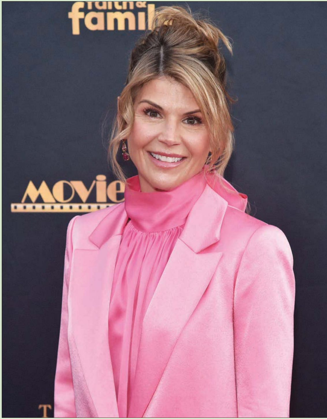
الممثلة الأمريكية لوري لافلين لدى حضورها حفل توزيع جوائز موفيغايدي في لوس أنجلوس بكاليفورنيا