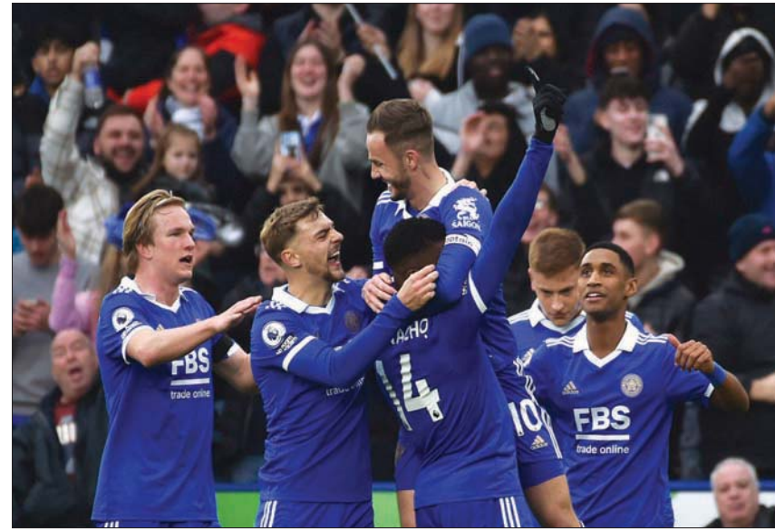
ليستر سيتي صعق توتنهام برباعية تاريخية أمس