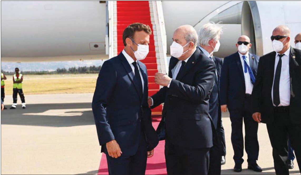
الرئيس الجزائري مستقبلاً نظيره الفرنسي بمطار الجزائر في أغسطس الماضي (الرائسة)

(نيسان) 1961. وفي هذا السياق، تساءل الدبلوماسي السابق عن «المؤشرات» التي تسمح للوكالة الناطقة باسم الحكومة بالحديث عن سيناريو مشابه. وينظره، فإن «المغالة إلى هذا الحد المضحك تنزع الصدقية والجديّة»، عما يصدر عن الجانب الجزائري. ثم إن العلاقات الفرنسية - المغربية تمر راهناً بإزمة صامتة، لعل أبرز مؤشرات أنها الزيارة التي بنوي الرئيس ماكرون القيام بها إلى الرباط لم تعد قيد التداول، رغم المهمة التي قامت بها وزيرة الخارجية كاترين كولونا إلى المغرب في 16 من ديسمبر (كانون الأول) الماضي، والتي كان غرضها تحديداً التحضير لها. ويعي جُل المراقبين أنه ليست لباريس علاقات ثنائية من جهة مع الجزائر، ومن جهة أخرى مع المغرب، بل هناك علاقة ثلاثية الأضلع، ذلك أن ما يقع في جانب ينعكس الأياً على الجانب الآخر، مؤكداً أن رغبة باريس في المحافظة على التوازن ليست مهمة سهلة. وليس سرا أن الرباط لا تظفر بعين الارتياح إلى التقارب الفرنسي - الجزائري، خصوصاً أن لديها «ماخذ» على الدبلوماسية الفرنسية، حيث إن باريس لا تبدو راغبة بالسير على الخطى الأميركية لجهة الاعتراف بـ«مغربية» الصحراء، كما فعلت إدارة الرئيس السابق دونالد ترمب، مقابل تطبيع العلاقات المغربية - الإسرائيلية، أو الاقتداء بما فعلته مدريد وبرلين لجهة الاقتراب من هذا الاعتراف. والواقع اليوم كما تقول مصادر عربية في باريس أن المغرب