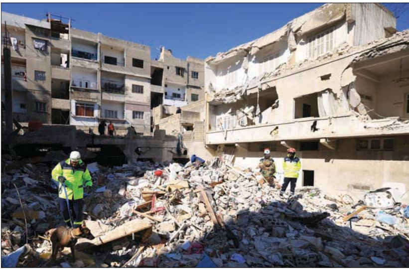
مسعف يستخدم كلباً للبحث عن ناجين في بلدة جبلة شمال غربي سوريا