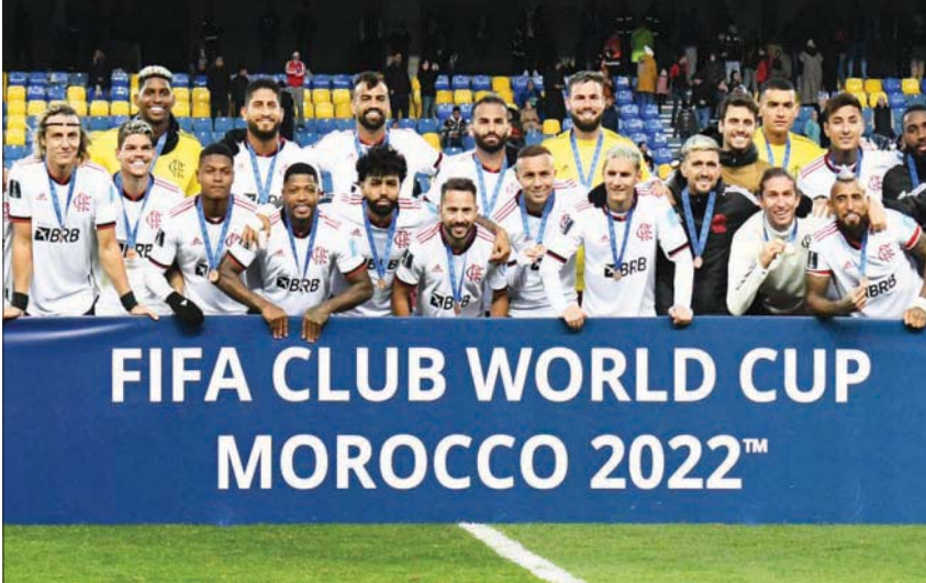
لاعبو فلاديمينغو لدى تتويجهم بالبرونزية