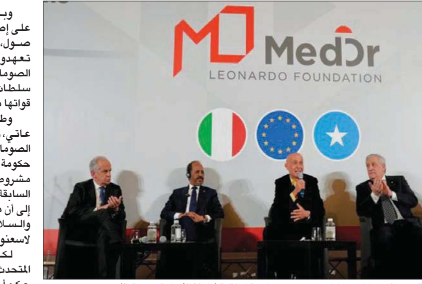
الرئيس الصومالي خلال مشاركته في ندوة بجامعة إيطالية