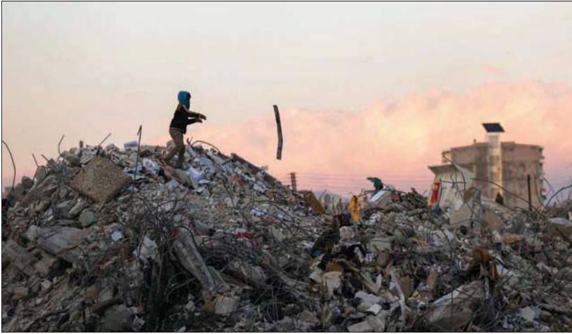
طفل سوري على أنقاض منزل في جبلة قرب اللاذقية