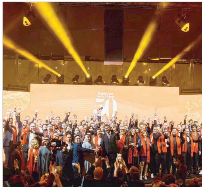
صورة جماعية للفائزين