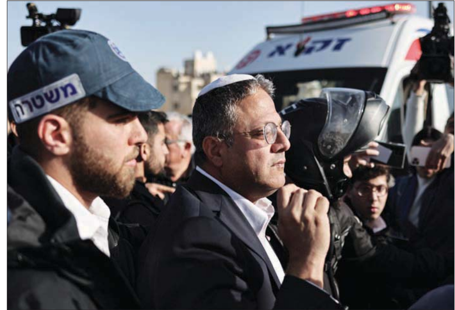
بن غفير خلال تفقده مكان عملية الدهس في القدس الشرقية أول من أمس (د.ب.أ)

وحسبه، فإن بن غفير لم يُنسّق مع رئيس الحكومة أو وزير الدفاع قبل أن يصرح، وإنه أصلاً لا يملك صلاحية إعلان ذلك ومطالب بتوضيحات. وأضاف: «نتنياهو سيخذ قراراً بشأن أي عملية بعد إجراء مناقشة أمنية مع الجهات المختصة، وهو لا يرى أن هناك ضرورة لاتخاذ عقوبات جماعية، خصوصاً في ظل الجهود لتهدئة الأوضاع قبل شهر رمضان وعيد الفصح اليهودي». إضافة إلى الحكومة التي ينتمي إليها، سخر زعيم المعارضة الإسرائيلية، يائير لابيد، من أומר بن غفير بشأن عملية «السور الواقي 2»، قائلاً إن وزير «التيك توك» و«خزيبنا» (في إشارة إلى إغلاقه مخابز أسرى فلسطينيين) أمر بشن عملية «سور واق 2» بدون قرار «كابيتال». «إذ لم يكن الأمر خطيراً، فهو سيخفي مثله».