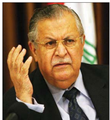
جلال طالباني

طلبت من ليلى خالد أن تروي قصة محاولة اغتيال حداد على يد «الموساد» لأنها كانت معه لحظة وقوع الهجوم، فأجابت: «كان وديع يلتزم إجراءات أمنية صارمة وكل تحركاته محاطة بسرية كاملة. لكنهم نجحوا في ضرب شقيقه في محلة الطريف في بيروت بسنة صواريخ الكريدي تيوباً لاحقاً منصباً رقيقاً فذهبت شكوكي إلى الرئيس العراقي الراحل جلال طالباني. اغتنمت فرصة لقاء معه خلال زيارة له إلى دمشق وطُف حداد صداقاته في خدمة قضيتهم. قالت خالد: «كان يطلب مني أن أذهب