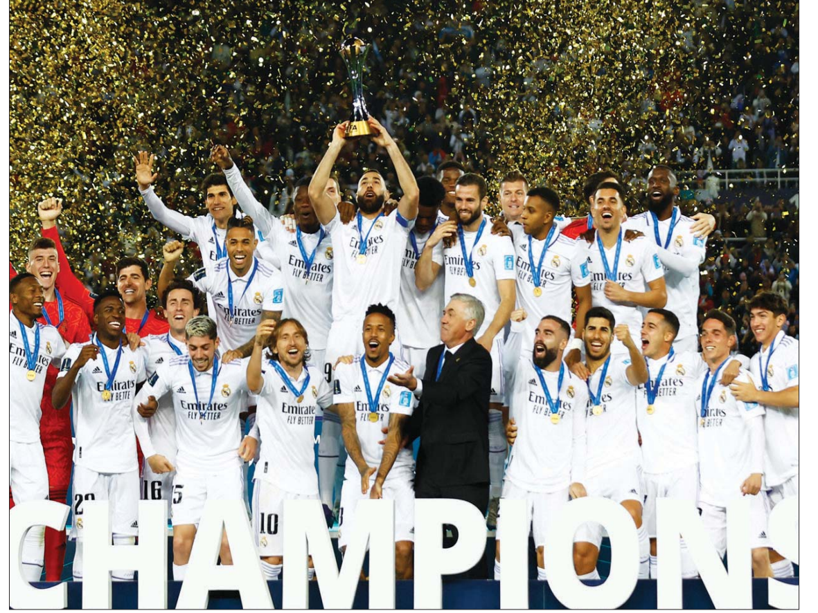
لاعب ريال مدريد خلال تتويجهم باللقب