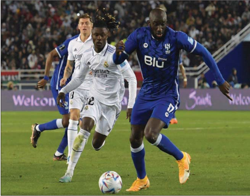
ماريغا في إحدى الهجمات الهلالية

ولم يرفع الهلال راية الاستسلام، إذ نجح البديل ميشال ديلجادو في قيادة هجمة زرقاء مع الدقيقة 79، وتجاوز دفاعات ريال مدريد ليمررها نحو فيفيتو الذي دار بالكرة وركنها داخل الشباك كهدف ثالث للهلال.