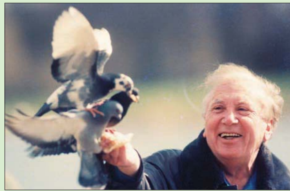
نزار قباني بعديته