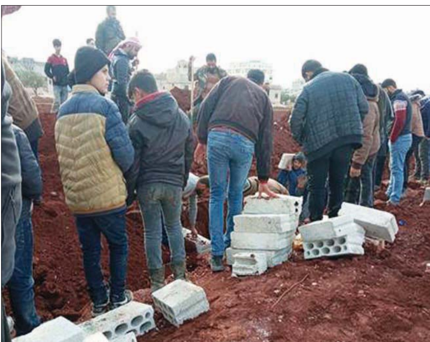
يدفنون قريباً لهم داخل سوريا (الشرق الأوسط)