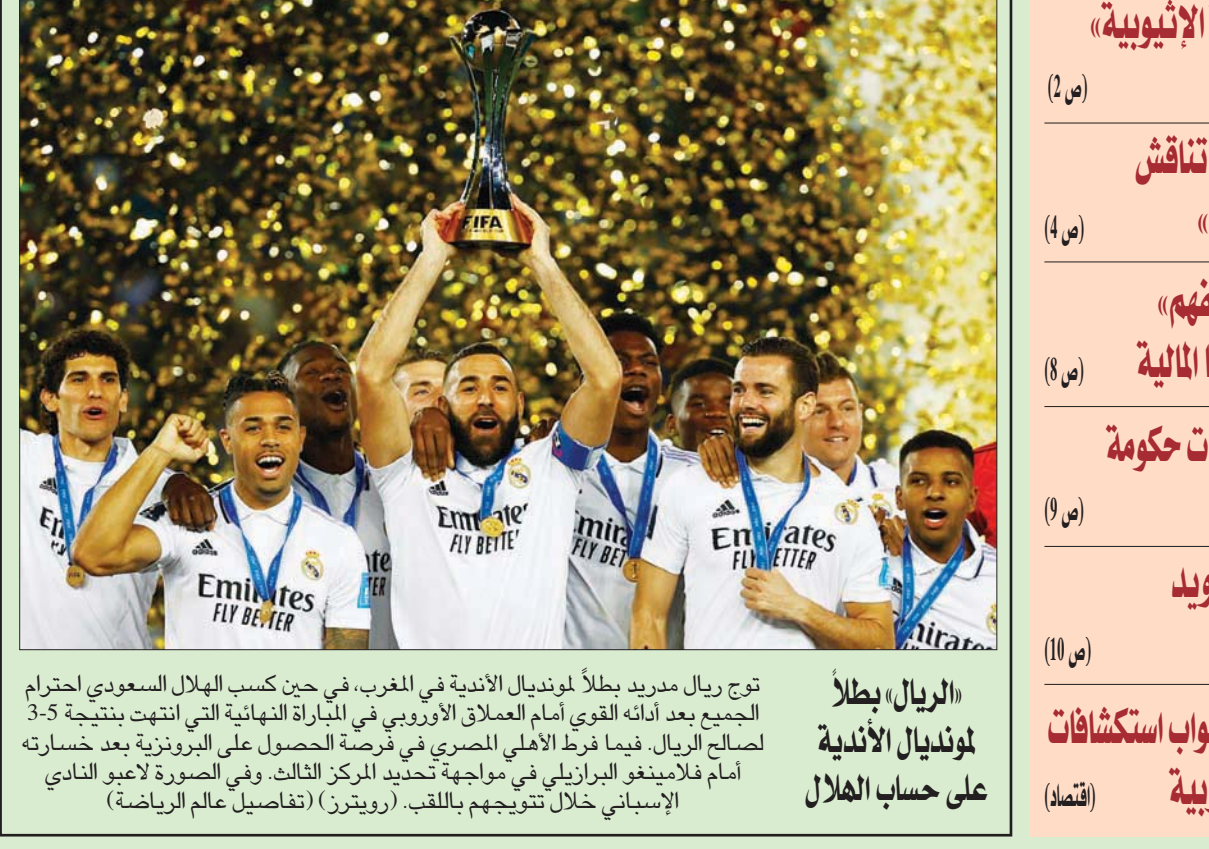
توج ريال مدريد بطلاً لوندبال الأندية في المغرب، في حين كسب الهلال السعودي احترام الجميع بعد أدائه القوي أمام العملاق الأوروبي في المباراة النهائية التي انتهت بنتيجة 3-5 لصالح الريال. فيما فرط الأهلي المصري في فرصة الحصول على البرونزية بعد خسارته أمام فلامينغو البرازيلي في مواجهة تحديد المركز الثالث. وفي الصورة لاعبو النادي الإسباني خلال تتويجهم باللقب. (رويترز) (تفاصيل عالم الرياضة)

بيروت، «الشرق الأوسط» يواصل المسؤولون عن المصارف اللبنانية أن يدفع تهديدهم بإضراب شامل في الأسبوع المقبل إلى الضغط لكسب اهتمام حكومة تصريف الأعمال ورئيسها نجيب ميقاتي، وتلبية الوعود غير المعلنة التي أعطاهم لهم خلال لقائه وفداً من مجلس إدارة جمعية المصارف، بالسعي لدى المراجع القضائية لإرساء صيغة مرنة تراعي الظروف الاستثنائية القائمة، التي لا تحمّل، كما تقول المصارف، أي «تجاوز أو تعسف» في البت بالدعاوى التي رفعها بعض المودعين ضد المصارف التي تحتجز أموالهم، وربما يصدر مجلس النواب قانون وضع الضوابط الخاصة على السحوبات والتحويلات (الكابيتال كونترول) الذي سيمسح السند القانوني لهذه الشكاوى. ووفقاً لتأكيدات مسؤول مصرفي كبير، تحدث لـ«الشرق الأوسط»، فإنه ومع افتراض عدم تحقيق تقدم في ترجمة المصارف عن قرار الإضراب الشامل سيصيب مكانتها كنواة للقطاع المالي وسمعتها المحلية والخارجية بالضرر، ما سيدفعها إلى تصعيد أكبر قد يطال وقف تشغيل آلات الصرف الآلي. إلى ذلك، أثار الدعوة التي وجهها رئيس البرلمان اللبناني نبيه بري، إلى هيئة مكتب المجلس للاجتماع غداً الاثنين، للاتفاق على جدول أعمال جلسة تشريعية، انتقادات قوى المعارضة، وعلى رأسها حزباً