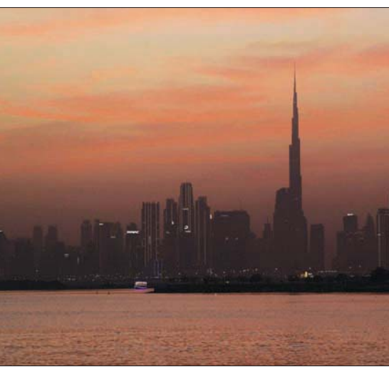
4 منتديات متخصصة تعقد في القمة العالمية للحكومات قبيل الانطلاق يوم غد في دبي (أ.ف.ب)

وتتناول الجلسة الثالثة بعنوان «إدارة مخاطر السياسة المالية»، نطاق إدارة مخاطر السياسة العامة والتحديات التي تواجهها الدول العربية. أما الجلسة الرابعة والأخيرة فبعنوان «تمويل احتياجات السياسة المالية: تعزيز تعيئة الإيرادات المحلية»، وستلقي الضوء على أهمية اتخاذ الإجراءات والسياسات اللازمة لحد من انتشار القطاع غير الرسمي الذي يصعب فرض