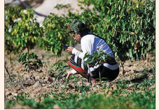
مزارع سعودي يتفقد محصول مزرعته في جنوب البلاد

وشهد العام الماضي، إعلان صندوق الاستثمارات العامة عن إطلاق الشركة السعودية للقهوة، بهدف دعم منتج القهوة المحلي والارتقاء به إلى المصاف العالمية في المستقبل، مؤكداً أن الشركة تهدف للقيام بدور رئيسي في تعزيز جهود تطوير الزراعة المستدامة في منطقة جازان بجنوب المملكة، باعتبارها موطناً رئيسياً للزراعة الأرابيكا الأشهر عالمياً. وأضاف الصندوق أن الشركة السعودية للقهوة تسعى لاستثمار نحو 1,2 مليار ريال (320 مليون دولار) على مدى السنوات العشر المقبلة في قطاع القهوة في البلاد، والمساهمة في رفع القدرة الإنتاجية للبلد للسويدي إلى 2500 طن سنوياً.