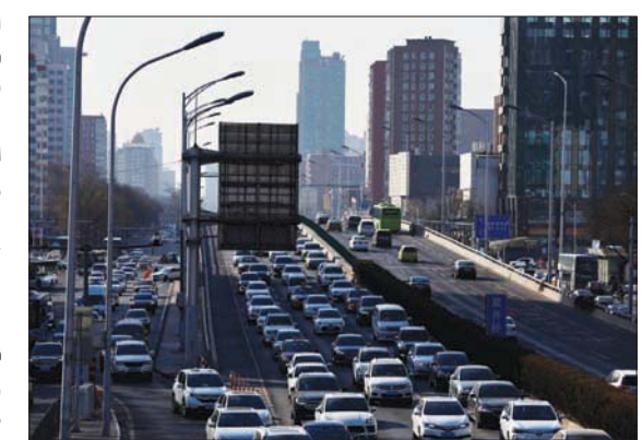
شارع مزدحم في العاصمة الصينية بكين التي خفت قيودها المتعلقة بكوفيد - 19، أخيراً

وجرت كذلك مناقشة عدد من القضايا المتعلقة بإدارة الاحتياطيات والسبولة والدعم الفني المقدم من المصرف المذكور لـ«البنك المركزي العراقي» وللقطاع المصرفي في العراق،