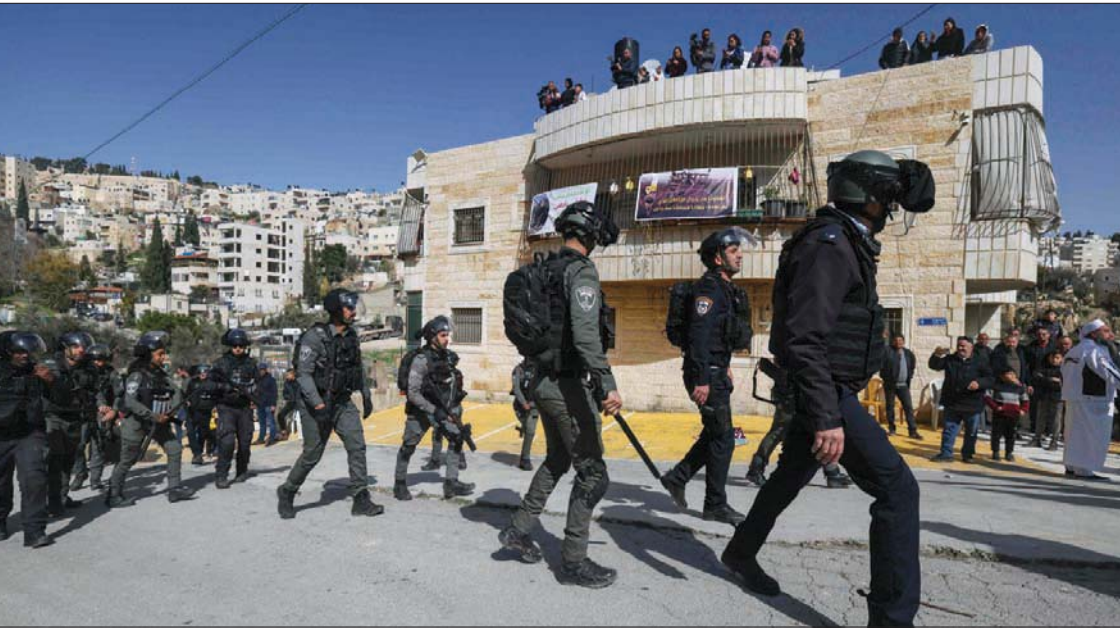
رجال أمن إسرائيليون في حي سلوان بالقدس الشرقية أول من أمس

وقال مسؤول سياسي إسرائيلي، إن المناقشات ستتناول الاستعدادات والسيناريوهات