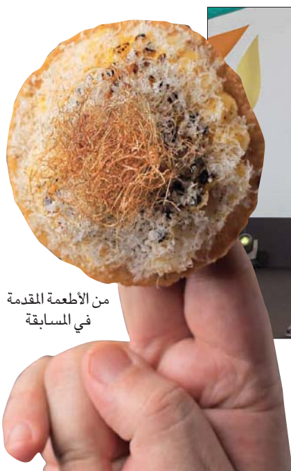
من الأطعمة المقدمة في المسابقة