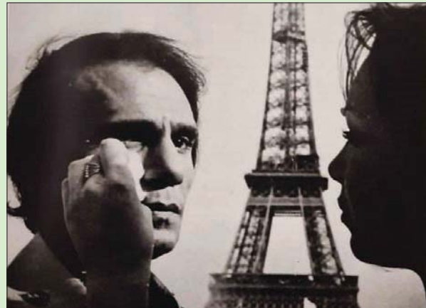
عبد الحليم في باريس