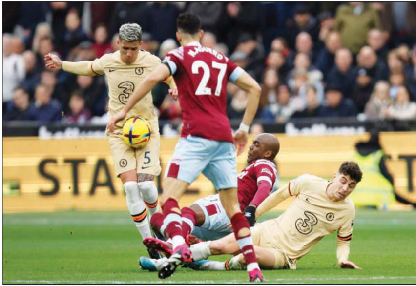
تشيلسي أخفق في الفوز على ويستهام

وانتهى الشوط الأول من المباراة بالتعادل السلبي، ثم أحرز لياندرو تروسارد هدف التقدم لآرسنال في الدقيقة 66، وتعادل إيفان توني لبرينتفورد في الدقيقة 74.