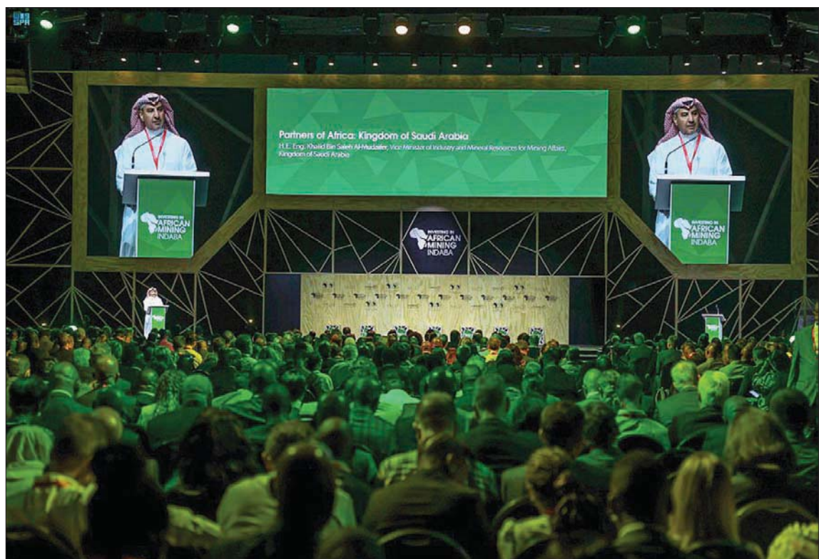
جانب من مشاركة السعودية الفاعلة في مؤتمر التعدين الأفريقي المنتهي الأسبوع الماضي

والمعلم أن نظام الاستثمار التعديني السعودي يوفر حوافز للمستثمرين، حيث يقر معدلات ضرائب متساوية وتنافسية للغاية للشركات المحلية والدولية، وطريقة سهلة ومنصفة وشفافة لتأسيس شركات مملوكة للأجانب بنسبة 100 في المائة.