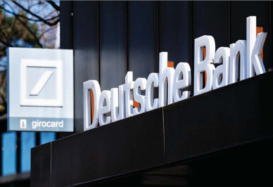
رئيس دويتشه بنك يقول إن استمرار التضخم المرتفع سيؤدي إلى انهيار الاستهلاك الخاص عاجلاً أم آجلاً (د.ب.أ)

وتجعل أسعار الفائدة المرتفعة القروض أكثر تكلفة، ويمكن أن يؤدي ذلك إلى إبطاء الطلب، وبالتالي مساعدة البنك المركزي الأوروبي على خفض