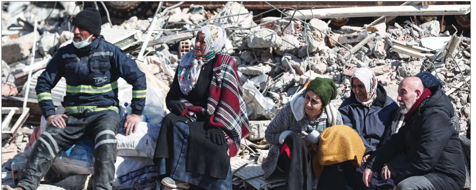
أقارب ينتظرون العثور على أحبائهم قرب أبنية مدمرة في أديامان بجنوب شرقي تركيا أمس

هذه في محاذاة حقل شاسع في إحدى ضواحي المدينة، إلى حيث تتوافد شاحنات لنقل الجثث بشكل متواصل لتفرغ حمولتها ثم تغادر. وأوضح المحقق: «إذا بقيت الجثة مجهولة الهوية، نأخذ بصمات الأصابع وعينة من الأسنان لمقارنتها بالإقارب» عندما يأتون. في هذه المقبرة المستحدثة، تم تعداد حوالي ألفي جثة، وفقاً للتقديرات، لكن مواكب جديدة تستمر في الوصول ناقلة جثثاً إضافية. وضعت لوحات لأسماء