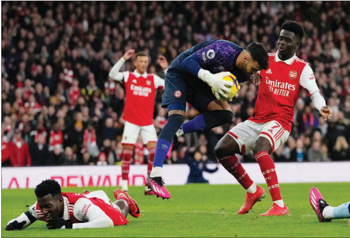
حارس برينتفورد رايا يعترض إحدى الهجمات الأرسنالية