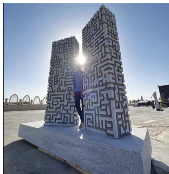
«بوابة النور» لانا ماريا نيغارا (الفنانة)

تقابل الكتل الحجرية أمامنا، تفصل بينها مساحات طفيفة ولكنها تركز على نقطة محددة، ومع انحناءاتها تجاه بعضها بعضاً وتفرقتها تظهر مساحات داخلية مربعة». يقول إنها تمثل: «الصمت وهو أمر أساسي ليستطيع الإنسان فهم غيره، يجب أن يسمع له أولاً». يعترف أن مادته المختارة للتعبير عن هذا المفهوم، وهي الغرانيت «ثقيلة جداً»، ولكنه استطاع ترويضها «بالنسبة لي من المهم تغيير ذلك التصور، بالنسبة لي تبدو القطعة خفيفة وطائرة»