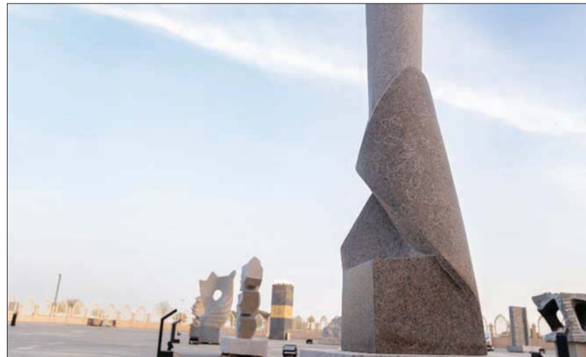
«تمكين - 2023» لحمد الثقفي (رياض آرت - ملتقى طويق)