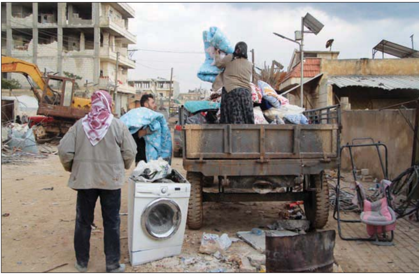
ناجون من الزلزال يجمعون أدوات منازلهم في حلب