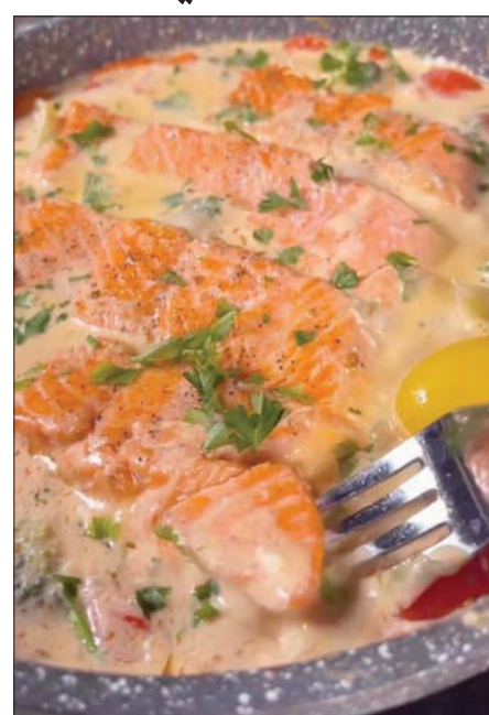
السلمون طبق سريع ولذيذ على طريقة سارة عاطف (إنستغرام)