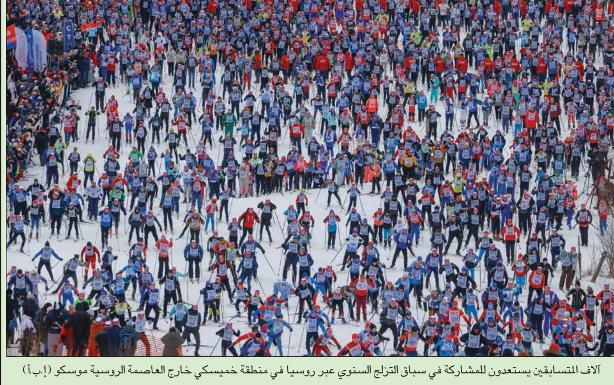
آلاف المتسابقين يستعدون للمشاركة في سباق التزلج السنوي عبر روسيا في منطقة خميسكي خارج العاصمة الروسية موسكو

فرانكفورت، «الشرق الأوسط» كشفت دراسة حديثة أن الأشخاص النشطين موسيقياً لديهم في المتوسط مخاطر وراثية أعلى قليلاً للإصابة بالاختئاب والأضطرابات ثنائية القطب. وتوسع نطاق أبحاثهم لتشمل طرقاً من علم الوراثة الجزيئي، معهد «ماكس بلانك» للجماليات التجريبية، بمدينة فرانكفورت الألمانية. وتأثير على الصحة النفسية وتلك التي تؤثر على الاهتمام بالممارسة الموسيقية. وتم نشر نتائج هذه الدراسة في مجلة «ترانسليشنال سايكياستري». وفي هذه الدراسة، تم فحص العلاقة الجينية بين ممارسة الموسيقى والصحة النفسية بناءً على الحمض النووي لـ 564 شخصاً. وقد أظهر التحليل أن الرجال والنساء الذين لديهم مخاطر أعراض اكتئاب أو احتراق نفسي أو ذهان. ونظراً لأن المشاركين في الدراسة كانوا من التوائم، تمكن العلماء أيضاً من أخذ التأثيرات العائلية مثل الجينات والتشوهات في الاعتبار. ووجد فريق البحث في ذلك الحين أنه من غير المحتمل أن تكون الأنشطة الموسيقية ومشكلات الصحة النفسية نتاجاً لبعضها. وأوضحت الباحثة الرئيسية في تلك الدراسة لورا ويسيلديك، قائلة: «هذا يعني أن الأفراد لا يمارسون