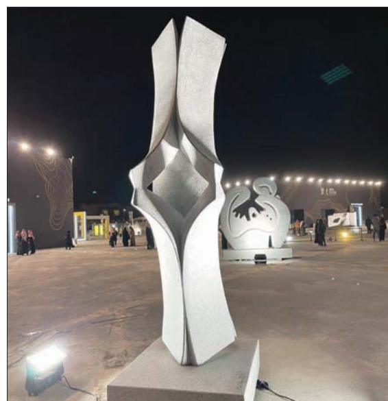
«تفاهم» لخورسيه ميلان

مساحة للتفاعل الاجتماعي والتأمل الهادئ. خوسيه ميلان: تفاهم عمل للفنان الإسباني خوسيه ميلان، الذي يحمل عنوان «تفاهم» من الأعمال التي توقف عندها الكثيرون. تمتع جداً الدوران حول عمل ميلان، فهو يتخذ شكلاً مغايراً في كل جهة. صنع عمله من الغرانيت وعبر من خلاله عن الصمت والفهم والتفاهم، عناصر من التواصل البشري، التي تنمو بالإنسان مثلما تنمو كتل الحجر الغرانيتي أمامنا بكل أنيقة ورفعة. يقول إن عمله يقدم تصوراً عن «كيف يمكن للأضداد أن تتفاعل، كيف يمكن أن تضع أربعة عناصر في مكان واحد تعكس فكرة تواصل الأضداد».