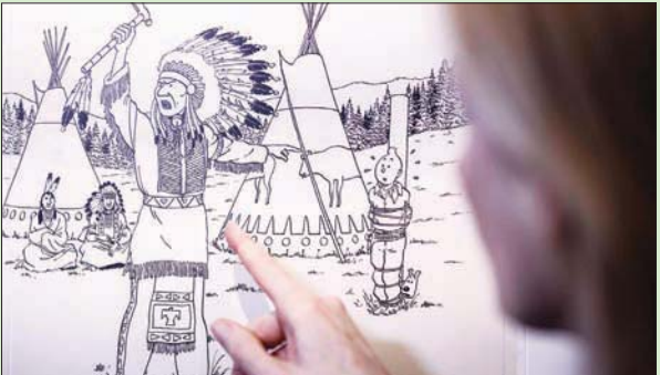
الرسم الأصلي للغللاف الذي رسمه الفنان إيرجيه عام 1942

وتستقطب الرسوم الأصلية للملشرايط المصورة في السنوات الأخيرة، عدداً متزايداً من هواة الجمع الذين غالباً ما يكونون من الأغنياء، وهو ما يفسر الأسعار العالية التي تجاع بها الأعمال. وليس الرسم الذي بيع للجمعة الغلاف الأصلي بالمعنى الدقيق للكلمة. إذ سبق للكتاب أن ظهر للمرة الأولى عام 1923 مع غلاف بيرز «تان تان»، مرتدياً زي رعاة البقر، ثم عام 1937 مع غلاف يمتطي فيه «تان تان» حصاناً.