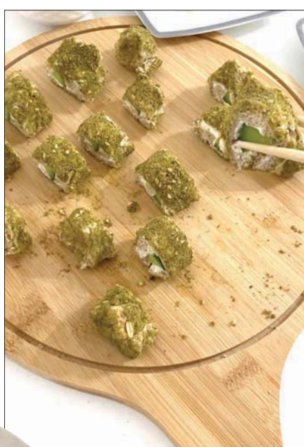
وصفات بنكهة خاصة وإضافات صحية