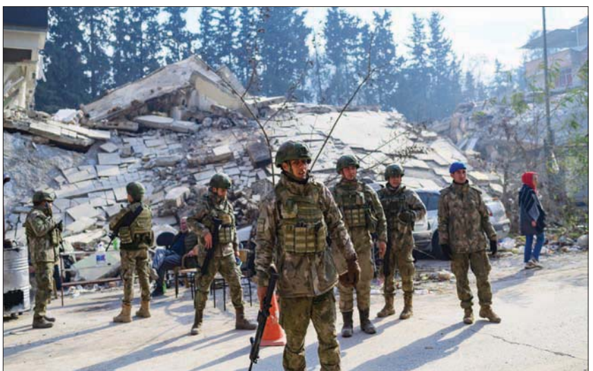
جنود أترك في هاتاي المنكوبة من الزلزال