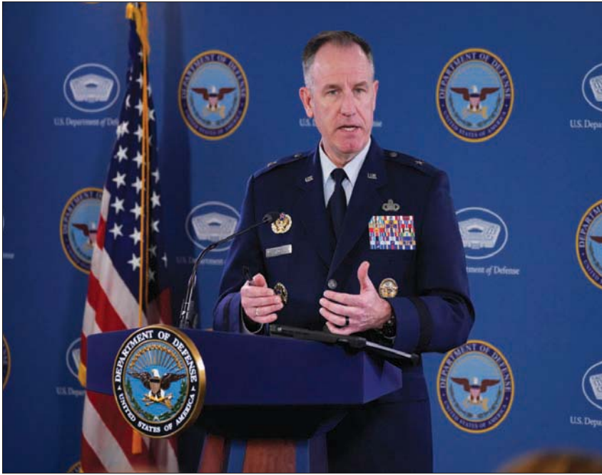
التحدث باسم «البنتاغون» البريغادير جنرال بات رايدر

وقالت وزارة التجارة إن التقدم العسكري. وقال ماثيو أكسلرود مساعد وزير التجارة لإنفاذ قوانين التصدير: «يُظهر إجراء اليوم جهودنا المتضافرة لتحديد وتعطيل استخدام جمهورية الصين الشعبية لبالونات المراقبة، والتي انتهكت المجال الجوي للولايات المتحدة وأكثر من أربعين دولة».