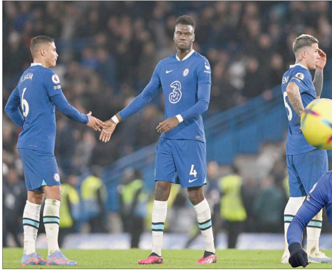
تشيلسي ما زال يعاني رغم إنفاقه أموالاً طائلة على ضم لاعبين