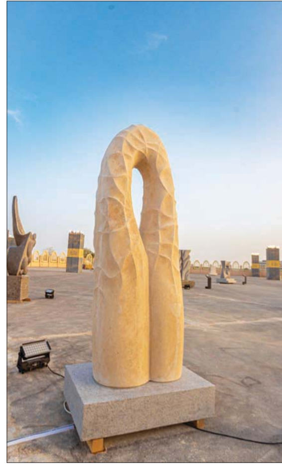
«تموج المحيط» ليليا بوبورنيكفا (رياض آرت - ملتقى طويق)