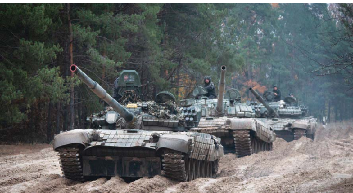
جنود أوكرانيون على دبابات روسية من طراز «تي - 72» استولوا عليها قريباً من الحدود البيلاروسية

من بداية العام الثاني، وتوسيع إدارة بايدن نوعية المساعدة العسكرية ونطاقها وتسريعها للحكومة الأوكرانية، بعد تقديم ذخيرة وأسلحة منطوقة، بما في ذلك دبابات القتال الثقيلة، وغيرها من المركبات القتالية المدرعة، فقد تؤدي إعادة إطلاق برامج الحرب غير النظامية، إلى تعميق مشاركة واشنطن، ومنح العسكريين الأميركيين السيطرة العملية على العملاء الأوكرانيين في منطقة الحرب.