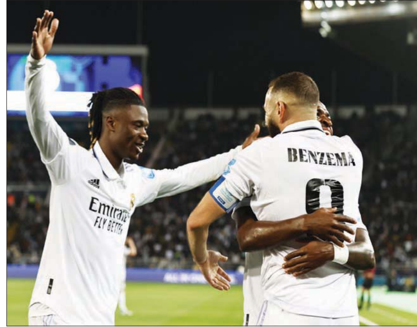
بنزيمة محتفلاً بعد الهدف الثالث للريال (إ.ب.أ)

بعد خمس دقائق من الهدف الأول، وذلك بعدما سدده فالفيديري كرة قوية سكنت شبك الهلال مع الدقيقة 18. كانت نقطة الهدف الثاني ترجم الحالة الفنية لفريق الهلال بعد أن تحولت الكرة المرتدة له إلى هجمة خطيرة على شبكته، بعد أن قطعت الكرة من سالم الدوسري وأرسلت ساقطة داخل منطقة الجزاء أبعدها جيانغ براسه، لتجد فالفيديري على قوس منطقة الجزاء سددها قوية سكنت الشباك.