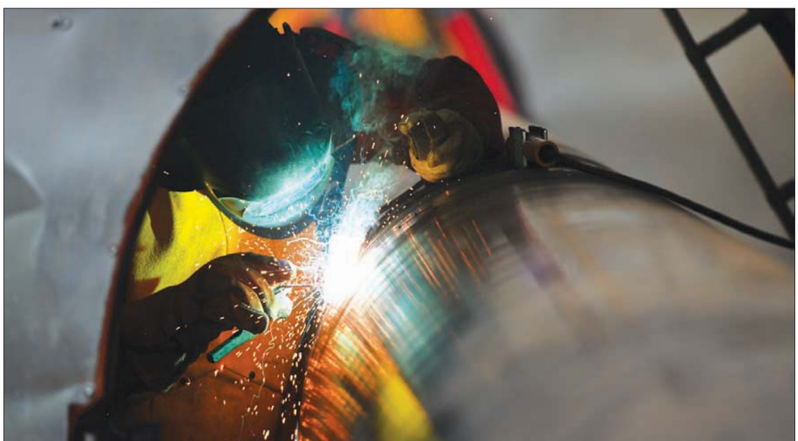
استمرار استكشافات الغاز خارج القارة الأوروبية وفي الصورة عامل يربط أنبوب نقل غاز بين بلغاريا وصربيا

وتابع الصبان، أنه في ظل بحث الدول الأوروبية عن أسواق بديلة للغاز والطاقة، إلا أنها لن تصل للاكتفاء، بسبب تزايد الطلب على الطاقة، ورفع القيود المتعلقة بالوقود البديلة، وعودة عجلة الاقتصاد الصيني مرة أخرى للاندفاع، وكذلك ارتفاع النمو الاقتصادي في الهند وعدد من الدول الأخرى، لافتاً إلى أن محدودية الاستكشافات الحالية ومحدودية العروض العالمي سيؤدي إلى وجود نقص حقيقي في إمدادات كل من