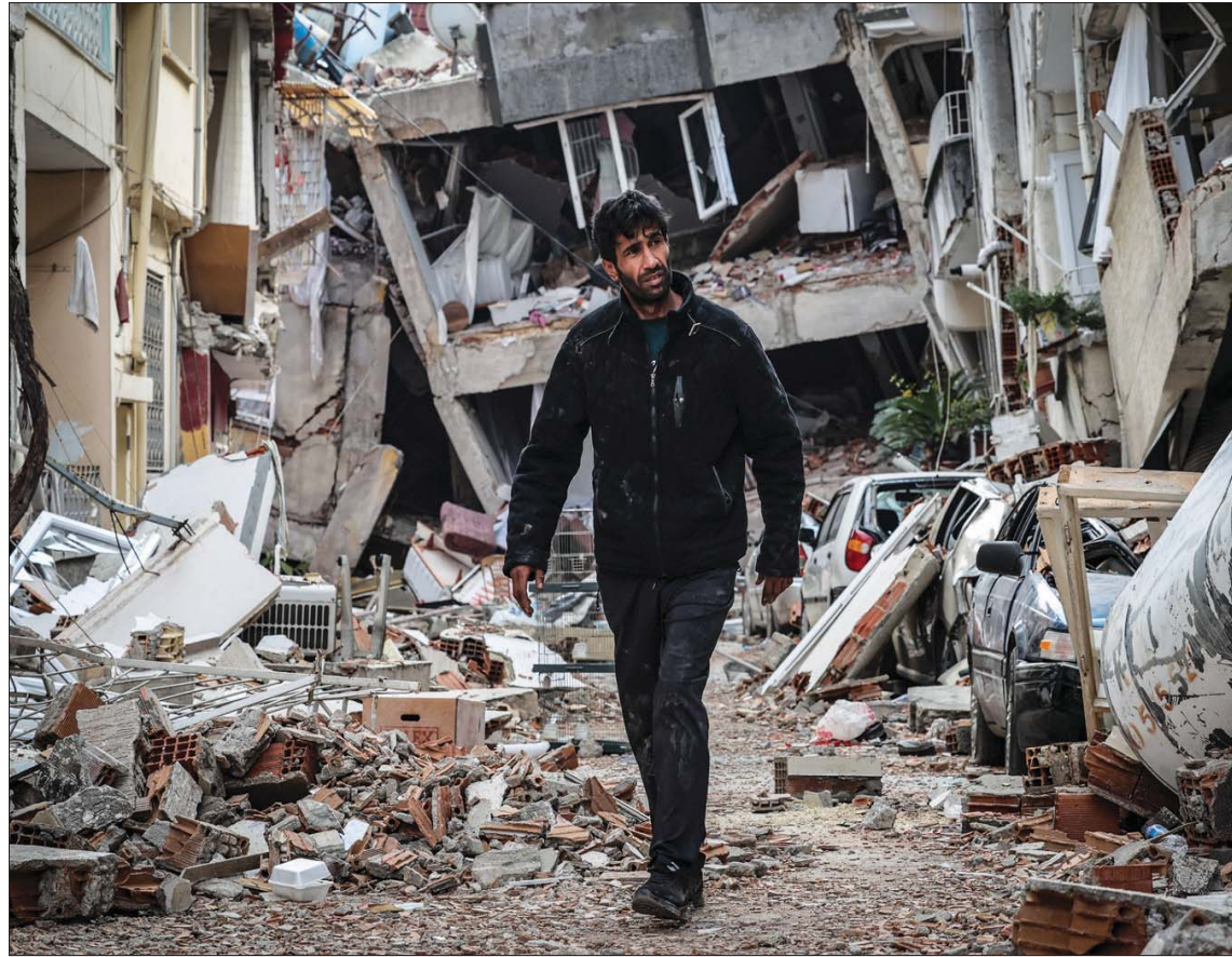
تركي ناج من الزلزال بين مبان مدمرة في أنطاكية أمس

ونجحت فرق الإنقاذ في إخراج 5 أفراد من عائلة واحدة من تحت أنقاض منزلهم، بعد 129