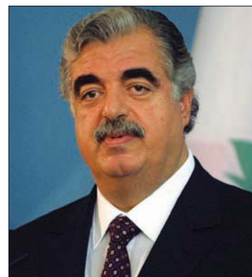
رفيق الحريري

واديح يطلب منه أن يأتي إلى لبنان. كان يقوم لوحده بإيصال الأسلحة. بعد 1972 لم نعد نراه». استفسرت إن كان الحريري ساهم - رغم تواضع إمكاناته آنذاك - في أي تمويل للمجموعة فكان الجواب: «لست متأكد، ما كانت قاعدة العمل في المجال الخارجي تقضي ألا يعرف أي شخص إلا ما يحتاج إليه للقيام بدوره». سألت عن سبب تكليف الحريري معروف هذا النوع وهو يعمل في السعودية فأجابت: «قلت لك ما أعرفه. ربما لأن جواز سفره لا يثير الشبهة». رفضت خالد الحديث عن الطريقة التي مرر بها الحريري السلاح في مطارات الدول الأوروبية الثلاث (فرنسا وإسبانيا وألمانيا).