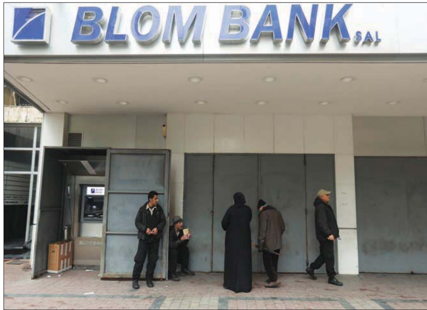
لبنانيون أمام فرع مقل لأحد المصارف في بيروت

بضفاف إلى أسباب عدم تأثير إضراب المصارف بشكل واسع، أن المؤسسات كانت فعلياً في وضعية شبه إقفال متصاعد قبل إعلان الإضراب، وتقتصر خدماتها على صناديق ضخ السيولة وفق نظام الحصص الشهرية للمودعين ورسد الرواتب للعاملين، ولا سيما منهم نحو 400 ألف من موظفي القطاع العام والمتقاعدين. أما الزيارات المتاحة للعملاء فهي بالأغلب تشمل الشركات التي لا يستطيع مندوبوها إتمام معاملاتهم عبر أجهزة الصراف، أو الأفراد الذين يطلبون إشارات بحساباتهم للحصول على ناشيرات سفر، وكذلك الراغبون بإعادة هيكلة قروضهم القائمة سابقاً، عبر سداد أقساط مستحقة أو كامل المبلغ المتبقي؛ بغية الاستفادة من فروقات أسعار الصرف الرسمية، والتي تماثل حالياً بالليرة، ورغم زعمها 10 أضعاف بدءاً من أول الشهر الحالي، أقل من 25 في المائة من القيمة السوقية للدولار.