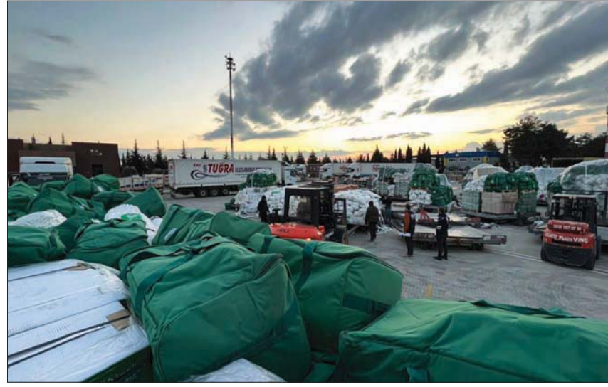
أطنان من المساعدات السعودية لمتضرري الزلزال في تركيا وسوريا تصل تباعاً للأراضي التركية (الشرق الأوسط)

وكشف المعلم في حديث خاص لـ «الشرق الأوسط» عن جهود لتسيير رحلات إغاثية مباشرة إلى مدينة حلب السورية خلال الساعات المقبلة، بعد استكمال التنسيق مع الهلال الأحمر السوري. وقال في رد على سؤال حول وصول الفرق الطبية السعودية إلى الجانب السوري: «نحن الآن في طور فتح المعابر وسيصلون قريباً بإذن الله، كما نؤكد الآن في تسيير طائرات مباشرة خلال الساعات المقبلة إلى مدينة حلب بعد إنهاء