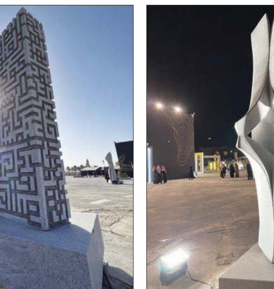
«تفاهم» لخورسيه ميلان (الشرق الأوسط)

مساحة للتفاعل الاجتماعي والتأمل الهادئ. خوسيه ميلان: تفاهم عمل للفنان الإسباني خوسيه ميلان، الذي يحمل عنوان «تفاهم» من الأعمال التي توقف عندها الكثيرون. تمتع جداً الدوران حول عمل ميلان، فهو يتخذ شكلاً مغايراً في كل جهة. صنع عمله من الغرانيت وعبر من خلاله عن الصمت والفهم والتفاهم، عناصر من التواصل البشري، التي تنمو بالإنسان مثلما تنمو كتل الحجر الغرانيتي أمامنا بكل أنيقة ورفعة. يقول إن عمله يقدم تصوراً عن «كيف يمكن للأضداد أن تتفاعل، كيف يمكن أن تضع أربعة عناصر في مكان واحد تعكس فكرة تواصل الأضداد».