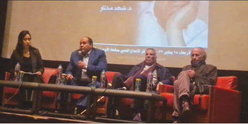
مشاركين في الندوة عن أعمال الروائي إبراهيم عبدالمجيد