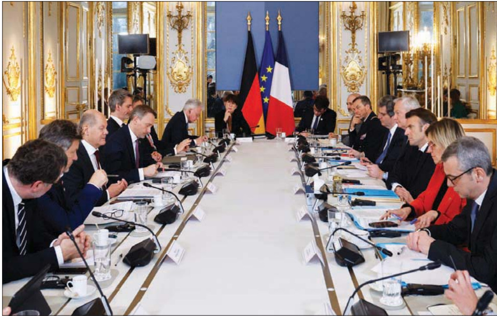
ماكرون وشوتس خلال جلسة البحوث الموسعة لوفدي البلدين في «الجزيرة» أمس

باريس - برلين - وارسو: «الشرق الأوسط» سلسلة من القضايا الرئيسية، من الطاقة إلى الدفاع، والتي ظهرت في أعقاب الحرب التي شنتها روسيا في أوكرانيا. وبالتالي تتجه الأنظار نحو هذا الاجتماع بين زعمي أقوى دولتين «المحرك» الفرنسي - الألماني ليصبح «الرائد» في إعادة تأسيس أوروبا». بينما أكد شوتس أن البلدين سيواصلان تقديم «أي دعم ضروري» إلى أوكرانيا. وبينما تجد القارة العجوز نفسها غارقة من جديد في الحرب منذ 11 شهراً، ويمتأسية الذكرى الستين لتوقيع معاهدة المصالحة بين البلدين، أكد الرئيس الفرنسي أن هذا «الغنائي» سيقوم «باختيار المستقبل» كما «فعل عند كل نقطة تحول في البناء الأوروبي».