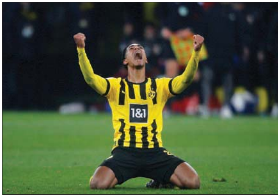
بيلينغهام يحتفل بتسجيل هدف دورتموند الأول

وكانت البطولة قد توقفت لمدة تزيد على شهرين، بسبب انقطاع بطولة كأس العالم لكرة القدم بقطر، في منتصف نوفمبر (تشرين الثاني) الماضي، وأعلنتها العطلة الشتوية. وتقدم بوروسيا دورتموند 3 مرات دون أن ينجح في الحفاظ