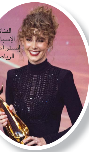
الفنانة الإسبانية إيستر أيسبو (موسم الرياض)

ونال الكثير من الفنانين العرب جوائز متنوعة في مجالات عدة، وهم الفنان المصري أحمد عز، الذي فاز بجائزة الممثل المفضل في فئة الأفلام، والفنانة التونسية السورية في الحفل، منير إلى المفضلة من دورها في فيلم «كيره والجن»، الذي فاز هو نفسه بجائزة الفيلم المفضل.