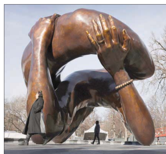
منحوتة «العناق» للفنان هانك ويليس توماس في مدينة بوسطن الأمريكية

الفنان هانك ويليس توماس، الذي اختير عام 2019 مع مجموعة التصميم الجماعي من بين 126 مشاركة، قال إنه مع العديد من المعالم