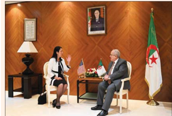
لعمامرة مع سيسون (وزارة الخارجية الجزائرية)