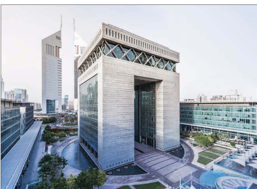
المركز المالي في دبي

مكتوم، نائب رئيس دولة الإمارات ورئيس مجلس الوزراء حاكم دبي، أسهمت في تعزيز مكانة الأسواق المالية في دبي. وقال الشيخ مكتوم بن راشد آل مكتوم، نائب رئيس دولة الإمارات ورئيس مجلس الوزراء حاكم دبي، أسهمت في تعزيز مكانة الأسواق المالية في دبي. وقال الشيخ مكتوم بن راشد آل مكتوم، نائب رئيس دولة الإمارات ورئيس مجلس الوزراء حاكم دبي، أسهمت في تعزيز مكانة الأسواق المالية في دبي.