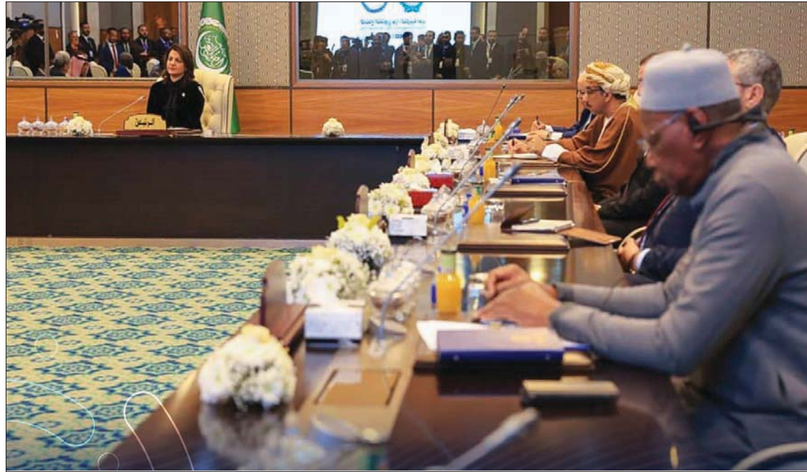
صورة وزعتها «حكومة الوحدة» للاجتماع العربي الوزاري بطرابلس

جزيرة إسبان بتاغوراء وإلى المطار، بحسب خريطة وزعتها مديرية أمن منفذ المطار . بدوره، قال محمد المنفي رئيس «المجلس الرئاسي» إن وزير خارجية الجزائر رطمان لعامرة، الذي التقاه أمس على هامش الاجتماع ونقل إليه تحيات الرئيس الجزائري عبد المجيد تبون وحرصه على «تعزيز الاستقرار في ليبيا وعودتها لدورها الطبيعي»، وجدد «تضامن بلاده ووقوفها الدائم إلى جانب المجلس الرئاسي والشعب الليبي، لتجسيد أولويات المرحلة الراهنة».