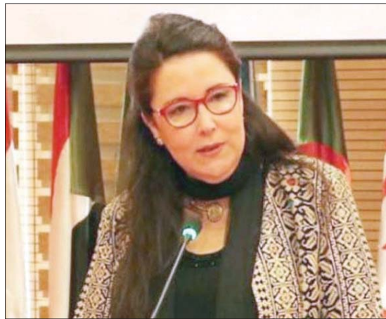
حياة قطاط القرمازي