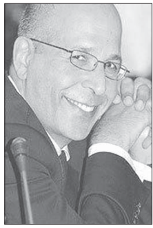
د. مأون فندي

إما هي موجودة أو غائبة. وإن لم تساندها قوة خشفة أيضاً تصبح عديمة الفائدة. أما موضوع التطابق بين القوتين، والذي يوصلنا إلى حالة القوة الذكية للدولة فيحتاج إلى تدقيق ودراسة متأنية.