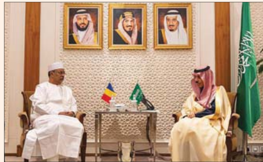
الأمير فيصل بن فرحان لدى لقائه الوزير محمد صالح التنظيف في الرياض (واس)

جاء ذلك لدى استقبال الأمير فيصل بن فرحان بن عبد الله وزير الخارجية السعودي نظيره التشادي محمد صالح التنظيف، فيما تم استعراض العلاقات الثنائية بين البلدين ومناقشة سبل دعمها وتعزيزها بما يخدم المصالح المشتركة، بالإضافة إلى تبادل وجهات النظر حيال القضايا الإقليمية والدولية ذات الاهتمام المشترك.