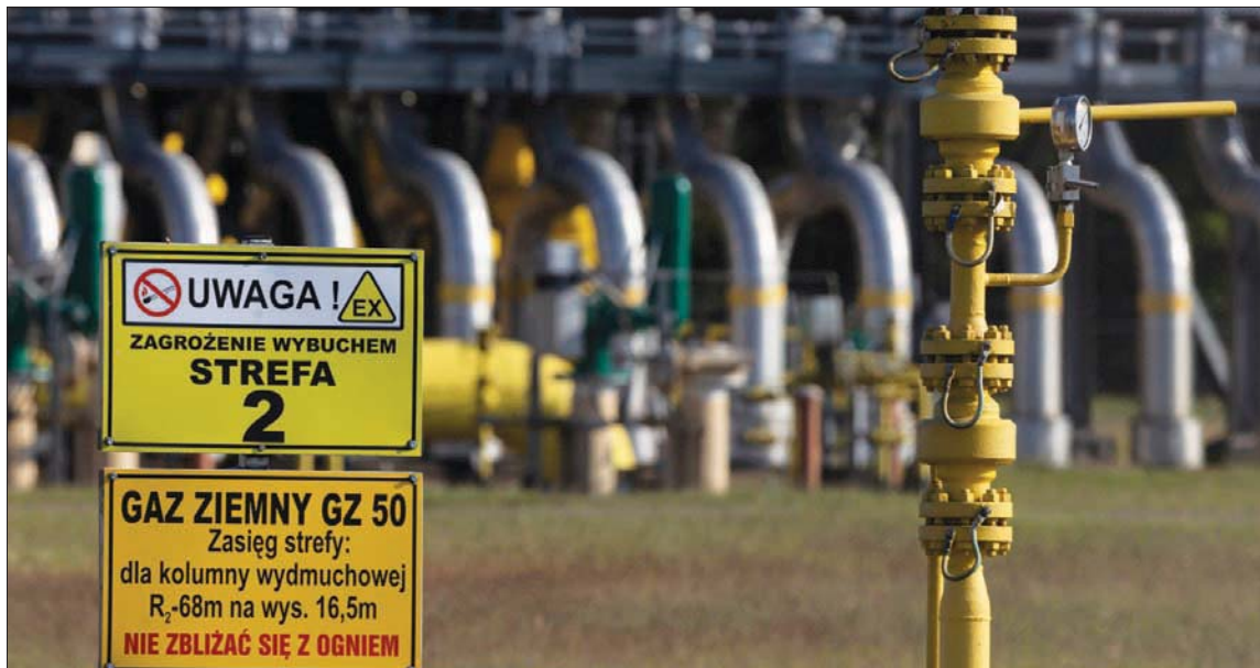
محطة غاز في بولندا مع ائتين تحذران من الاقتراب منها

فبراير ومارس. وتوقعوا ألا تكتفي بذلك، وأن يتخذ مزيد من الخطوات في مايو (أيار) ويونيو (حزيران)، وفي مقابلة منفصلة مع صحيفة «لا ستاسيا» الإيطالية نشرت أمس أيضاً، قال كونت إن من السابق لأوانه توقع ما إذا كان يتعين على المركزي الأوروبي إبطاء وتيرة رفع أسعار الفائدة بحلول الصيف. وتابع قائلاً: «في مرحلة ما بالطبع، ستصبح المخاطر المتعلقة بتوقعات التضخم أكثر توازناً... وسياتي وقت يمكننا فيه اتخاذ خطوة أخرى لخفض التوتيرة من 50 إلى 25 نقطة أساس على سبيل المثال. لكن ما زلنا بعيدين عن ذلك».