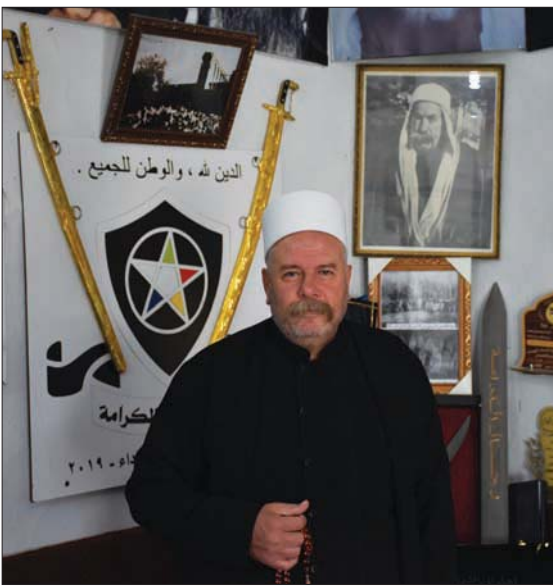
الشيخ يحيى الحجار

فكانت التصدي لهجوم جبهة النصرة على قرية دير داما عام 2014، كما تمكنت من طرد تنظيم «داعش» من قرى الريف الشرقي بالسويداء بعد الهجوم الذي نفذته التنظيم على القرى الدرزية عام 2018. ونفذت الحركة في يوليو 2022 عمليات عسكرية تصدت لمجموعات مرتبطة بالأجهزة الأمنية السورية، أبرزها ما عرف باسم «قوات الفجر» في السويداء، التي كانت تمارس الانتهاكات بحق الأهالي، وتعمل في تجارة وترويج المخدرات، وتمكنت الحركة من تصاردها معمل لإنتاج المخدرات كانت تستخدمه المجموعة.