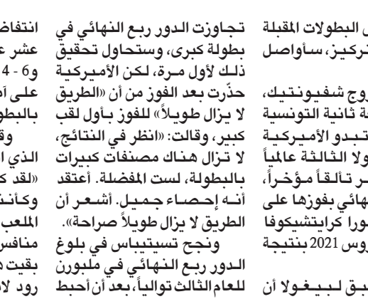
تسيتيباس نجح من فخ سينر

انتفاضة سينر المصنف السادس عشر عالمياً، ليخرج فائزاً 4-6 و6-3 و6-6 و3-6 مبقياً على أماله في الفوز بأول لقب بالبطولات الأربع الكبرى.