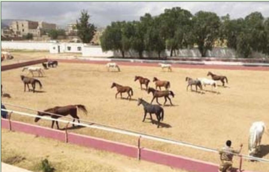
جانب من نادي الفروسية بصنعاء، الذي باعه الحوثيون

وتظهر البيانات المتوافرة أنه كان يستقبل خلال العطلات والاعياد بين 1500-2000 شخص، كما أن ممارسة هذه الرياضة في النادي قبل الانقلاب لم تكن حكراً على الذكور وحدهم، بل إن عدد منتسبيه من الإناث وصل إلى 30 في المائة. يشار إلى أن الرئيس اليمني الراحل علي عبد الله صالح، كان دعم تأسيس النادي وأهداه 13 حصاناً من الخيول من أصل 30 حصاناً كانت بحوزته في دار الرئاسة من مسؤولياتهم، والتدخل العاجل بسرعة الإفراج عن المختطفين، وإدانة تلك الأعمال الإرهابية تقوض جهود عملية السلام في اليمن، وتضع الجهود الأممية لصناعة السلام في مهبط الريح»؛ وفق ما جاء في البيان.