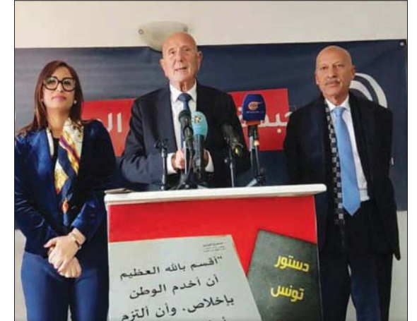
قيادات «جبهة الخلاص» (الشرق الأوسط)

تونس: المنجي السعيداني أعلنت السلطات التونسية صباح الأحد، وفاة كهل تونسي يبلغ من العمر 41 سنة إثر إضرامه النار ليل السبت في جسده أمام مقر ولاية (محافظة) نابل (شمال شرقي تونس)، وهو ما أعاد إلى أذهان التونسيين حادثة إضرام محمد البوعزيزي، مؤجج الثورة التونسية، النار في جسده قبل نحو 13 سنة، وبالتحديد يوم 17 ديسمبر (كانون الأول) 2010. وذكرت مصادر إعلامية محلية، أن الضحية حضر مساء السبت أمام مقر الولاية (المحافظة) وسكب مادة