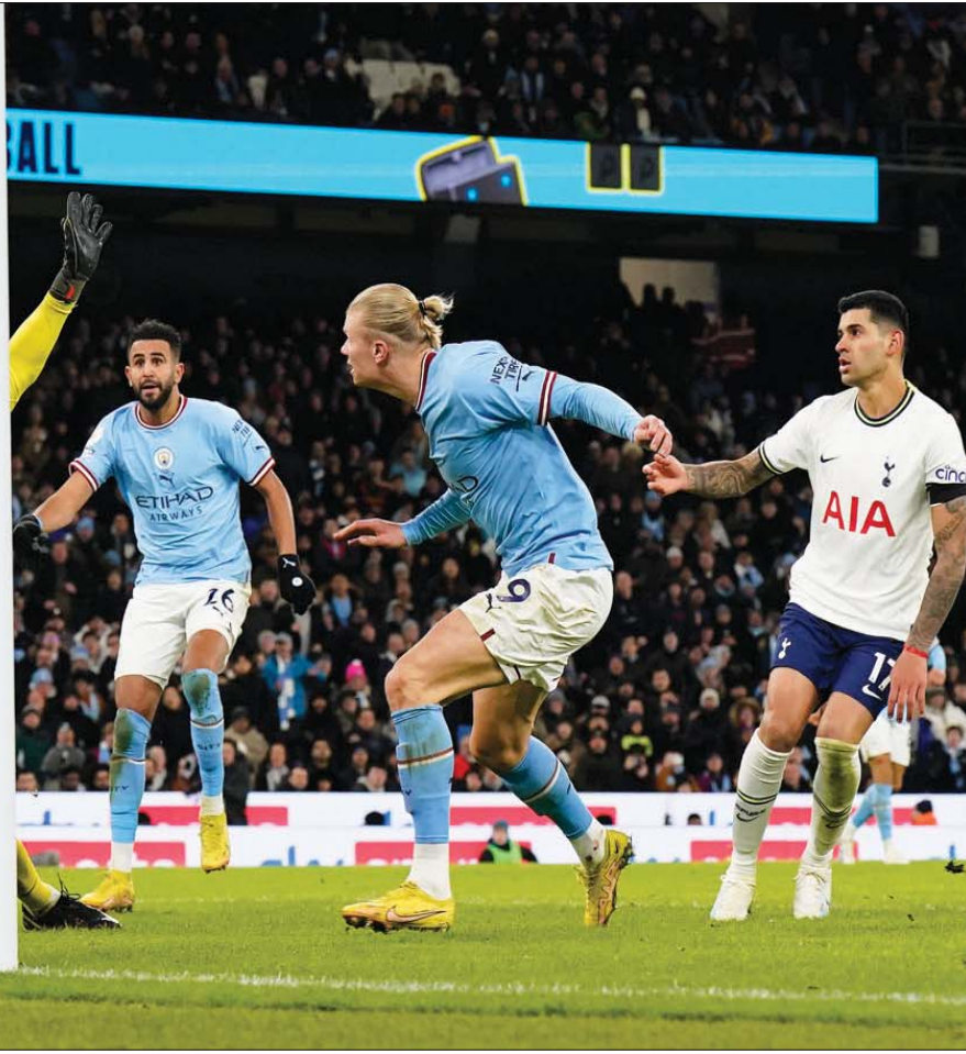
هالاند يسجل برأسه في مرمى توتنهام بعد 3 مباريات صام فيها عن التهديف