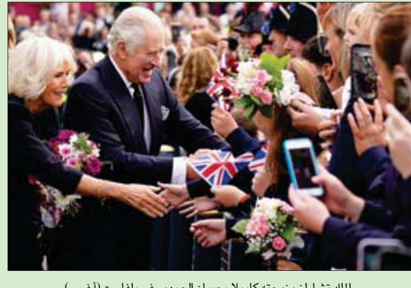
الملك تشارلز وزوجته كاميليا يحييان الجمهور في بلغاست