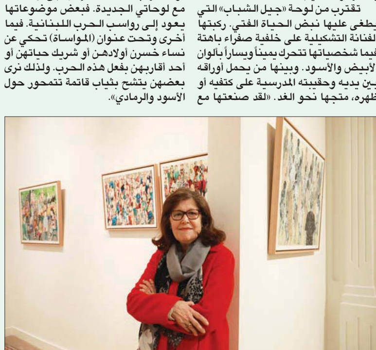
هيبت بواب تقدم فن التصليق بدقة متفانية (خاص الفنانة)

محجورات ثمينة مرصعة بأحجار كريمة. وأكون على علم مسبقاً إلى أين أريد الوصول بالفكرة وتفصيلها». تقرب من لوحة «جيل الشباب» التي يطغى عليها نبض الحياة الفني. ركبتها الفنانة التشكيلية على خلفية صفراء باهتة نساً خسران أولادهن أو شريك حياتهن أو أحد أقاربهن بفعل هذه الحرب. ولذلك نرى بعضهم يتشج بتياب قاتمة تتمحور حول الأسود والرمادي».