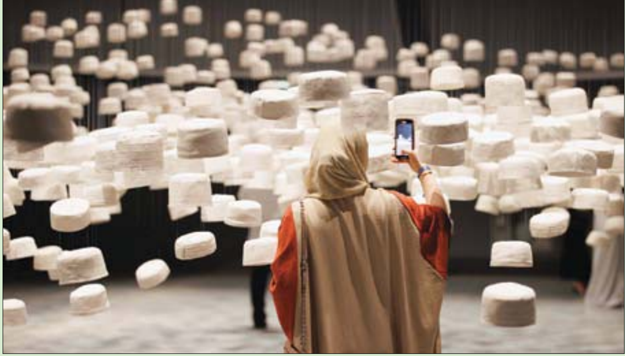
زائرة تلتقط صورة لقبعات الحجاج في البينالي

برنامج ثقافي مصاحب، يضم كثيراً من الأنشطة والندوات وورش العمل ومخيم أطفال وغيرها، فعلى مدى 90 يوماً هي مدة البينالي سيرى الزوار ما يشهدهم. من ناحيته، أوضح القيم الفني الدكتور سعد الراشد لـ«الشرق الأوسط» أن بينالي الفنون الإسلامية في جدة يستلهم من أهمية المكان باعتباره بوابة الحرمين الشريفين، وبسعى إلى إبراز جوانب من الفنون الإسلامية المتصلة بالحرمين الشريفين، مكة المكرمة والمدنية المنورة، ودور الحج إلى جانب جمع عدد من التحف والمخطوطات الإسلامية من أقطار أخرى، بما يؤكد على امتداد الحضارة الإسلامية، وجمعها في بوتقة واحدة.