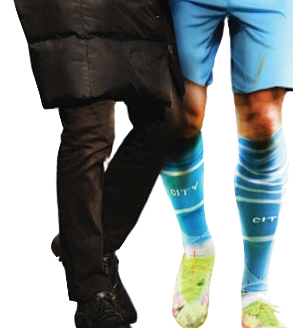
غوارديولا غير خطته من أجل هالاند