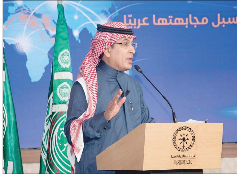
رئيس اتحاد إذاعات الدول العربية محمد بن فهد الحارثي

صياغات فزع تلقتي هذه التحذيرات مع «صياغات فزع» مماثلة كانت قد صدرت عن خبراء من مؤسسة إعلامية إسبانية وأفريقية وإسلامية وأوروبية خلال يومين من الجلسات العلمية والورشات المفتوحة. وغدا التحدي الكبير في عالم الاتصال والإعلام الرقمي «ثقافياً مجتمعياً» و«أخلاقياً معرفياً»، مثلما ورد في مداخلات مندوبي منظمته «اليونيسكو» و«الإلكسو» وهيئات حماية المعطيات الشخصية، وسامى الهبشري ممثل الأمانة العامة لمجلس وزراء الداخلية العرب. وإن حذرت وإعلاميين الأكاديميين والإعلاميين العرب وممثلي شركات التكنولوجيا الرقمية العالمية، في المناسبة، من تراجع تدابير «وسائل الإعلام التقليدية» لصالح «شبكات التواصل الاجتماعي ومنصات الإعلام الجديد والفيديوهات غير المرئية التي تصل يوماً إلى مليارات من الأطفال والشباب والكهول من الجنسين بلا رقي»، تقرر