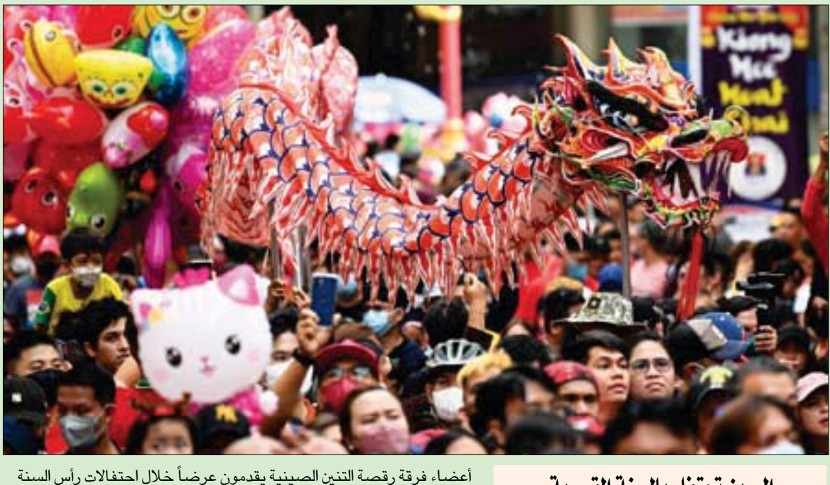
أعضاء فرقة رقصه التين الصينية يقدمون عرضاً خلال احتفالات رأس السنة القمرية الجديدة في منطقة الهى الصيني في مانليا أمس

القاهرة: حازم بدر أظهرت دراسة قادها باحثون من معهد الدماغ بباريس، وشارك فيها فريق بحثي من 8 بلدان، النتائج الواعدة لدواء «البريجليتانزون»، في وقف تدهور الغدة الكظرية الدماغية (CALD)، حيث تتم مهاجمة أغلفة الخلايا العصبية، ويتم تعطيل تدفق النبضات العصبية، ويؤدي هذا إلى تدهور سريع في الإدراك والحركة، والذي يمكن أن يكون قاتلاً في غضون بضعة سنوات. ويبدو أن السيطرة على الالتهاب هي وسيلة لإبطاء تطور المرض وتقليل الأعراض، وهذا هو المسار الذي سلكه فاني موخيل، الأستاذ بمعهد باريس للخطية والعصبية لمدة عامين ووجدوا أن تناول الدواء ساهم في تنظيم التعبير عن الجينات التي تساهم في الالتهاب العصبي والتعكس العصبي المرتبط بالمرض. أظهرت دراسة قادها باحثون من معهد الدماغ بباريس، وشارك فيها فريق بحثي من 8 بلدان، النتائج الواعدة لدواء «البريجليتانزون»، في وقف تدهور الغدة الكظرية الدماغية (CALD)، حيث تتم مهاجمة أغلفة الخلايا العصبية، ويتم تعطيل تدفق النبضات العصبية، ويؤدي هذا إلى تدهور سريع في الإدراك والحركة، والذي يمكن أن يكون قاتلاً في غضون بضعة سنوات. ويبدو أن السيطرة على الالتهاب هي وسيلة لإبطاء تطور المرض وتقليل الأعراض، وهذا هو المسار الذي سلكه فاني موخيل، الأستاذ بمعهد باريس للخطية والعصبية لمدة عامين ووجدوا أن تناول الدواء ساهم في تنظيم التعبير عن الجينات التي تساهم في الالتهاب العصبي والتعكس العصبي المرتبط بالمرض.