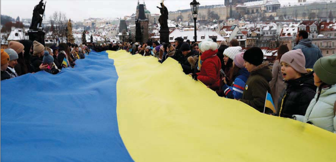
إحياء «يوم الوحدة الأوكرانية» عبر رفع علم أوكراني ضخم في العاصمة التشيكية براغ أمس