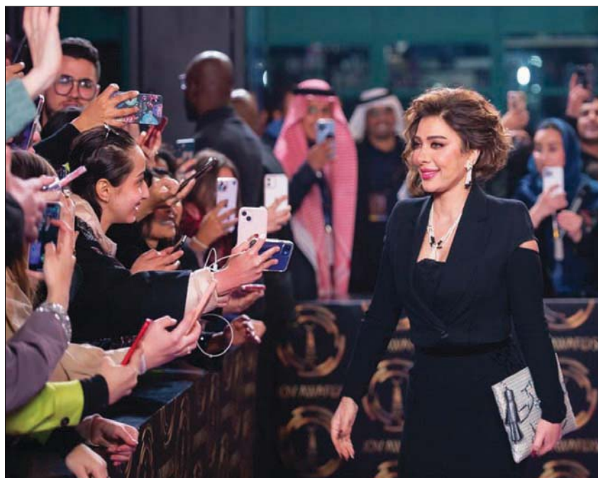
الفنانة السورية أصالة (موسم الرياض)

وإضافة إلى ذلك، كُرم الفنان أحمد حلمي وزوجته منى زكي بالجائزة الفخرية، كما كُرم بها أيضاً المخرج الأمريكي مايك باي، والمطرب السعودي راشد الماجد، والطربة الكويتية نوال، والممثلة الإسبانية إيستر أيسبو، ووليد آل إبراهيم مالك مجموعة «MBC» تقديراً لجهوده الإعلامية ودعمه