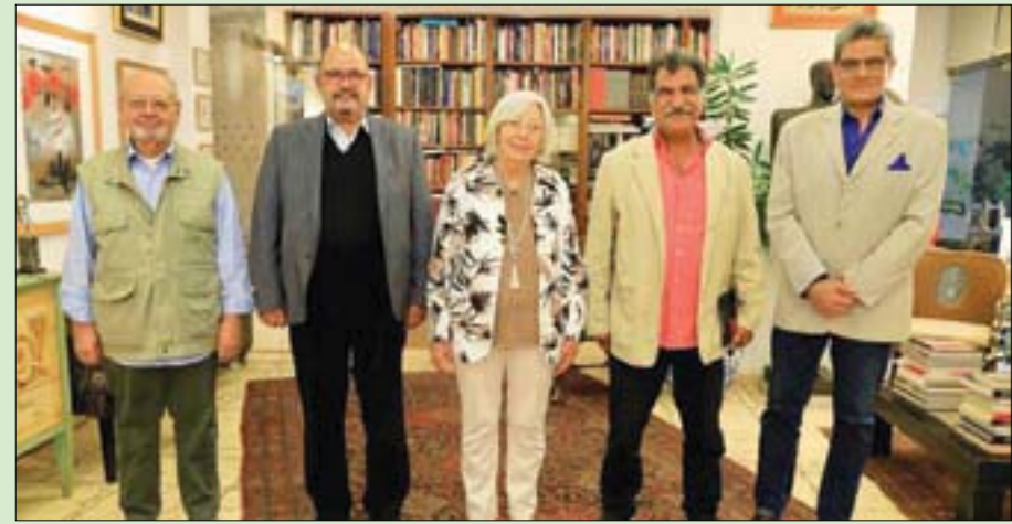
أعضاء لجنة تحكيم مسابقة الرسم (مؤسسة فاروق حسني للثقافة والفنون)

من مختلف أنحاء الجمهورية في المسابقة هذا العام». ومن المقرر أن يُسلم المتسابقون في فروع الرسم والنحت والعمارة والتصوير أعمالهم إلى المؤسسة مع بداية الأسبوع المقبل، لتستكمل لجان التحكيم عملها، تمهيداً لإعلان القائمة القصيرة من المتأهلين للمراحل النهائية، في جميع الفروع، على أن يتم توزيع الجوائز في حفل يقام شهر مارس المقبل، ويعرض الأعمال الفنية المشاركة في المسابقة، بحسب المؤسسة، التي أكدت انتهاء لجنة تحكيم مسابقة النقد الفني التشكيلي من تحكيم الأعمال المتقدمة للمسابقة، وعددها 21 دراسة نقدية، بزيادة 23 في المائة على الدورة السابقة. وتقدم لجائزة الرسم 546 متسابقاً بعدد 1092 عملاً فنياً بزيادة 31 في المائة على الدورة السابقة، بينما تقدم لجائزة العمارة 72 متسابقاً بعدد 32 مشروعاً معمارياً بزيادة 11 في المائة على الدورة السابقة، في حين تقدم لجائزة