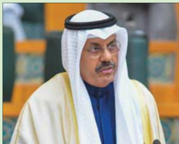
الكويت، ميرزا الخويلدي

تصاعدت حدة الأزمة السياسية مجدداً في الكويت، مهددة بطرح خيار استقالة الحكومة اليوم الاثنين، إثر خلاف مع مجلس الأمة (البرلمان) بشأن الاتفاق على حزمة معونات مالية يرغب النواب في دفع الحكومة لإقرارها، مقابل التنازل عن مطلب شراء القروض.