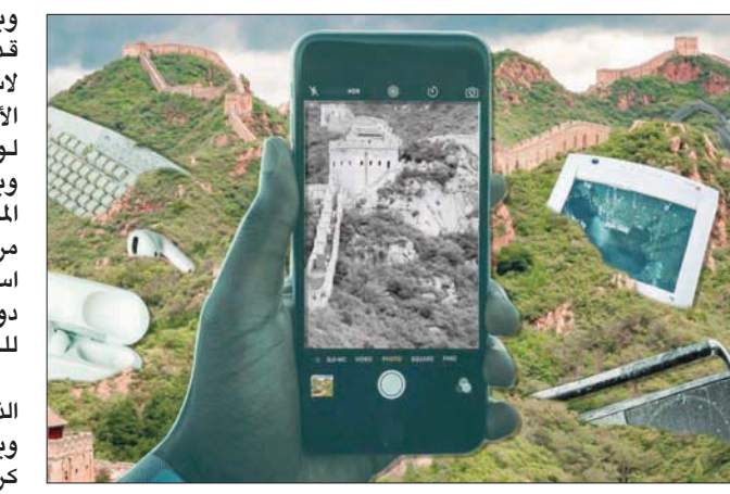
رسم توضيحي لنفايات إلكترونية يفوق حجمها سور الصين العظيم