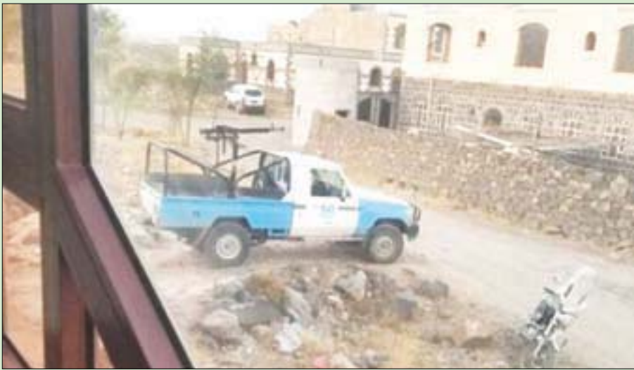
عربة عسكرية تابعة للحوثيين تحرس عقاراً استولت عليه الميليشيات في مديرية همدان شمال صنعاء

ويرى المراقبون أن عمليات السطو والنهب الحوثية المنظمة وكذا الشراء النشط في الوقت الحالي للأراضي والعقارات يأتي ضمن عملية التغيير الديموغرافي التي تنفذها الميليشيات في صنعاء ومدن أخرى بهدف التوسع بعيد المدى وتغيير البنية السكانية للمدن تحت قبضتها.