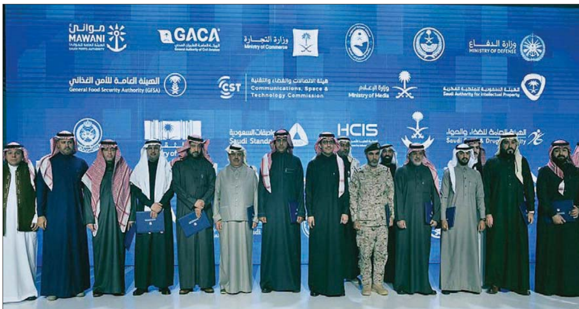
مسؤولو المنظومة الجمركية أمس في الرياض خلال إعلان مبادرة «الفسخ خلال ساعتين»