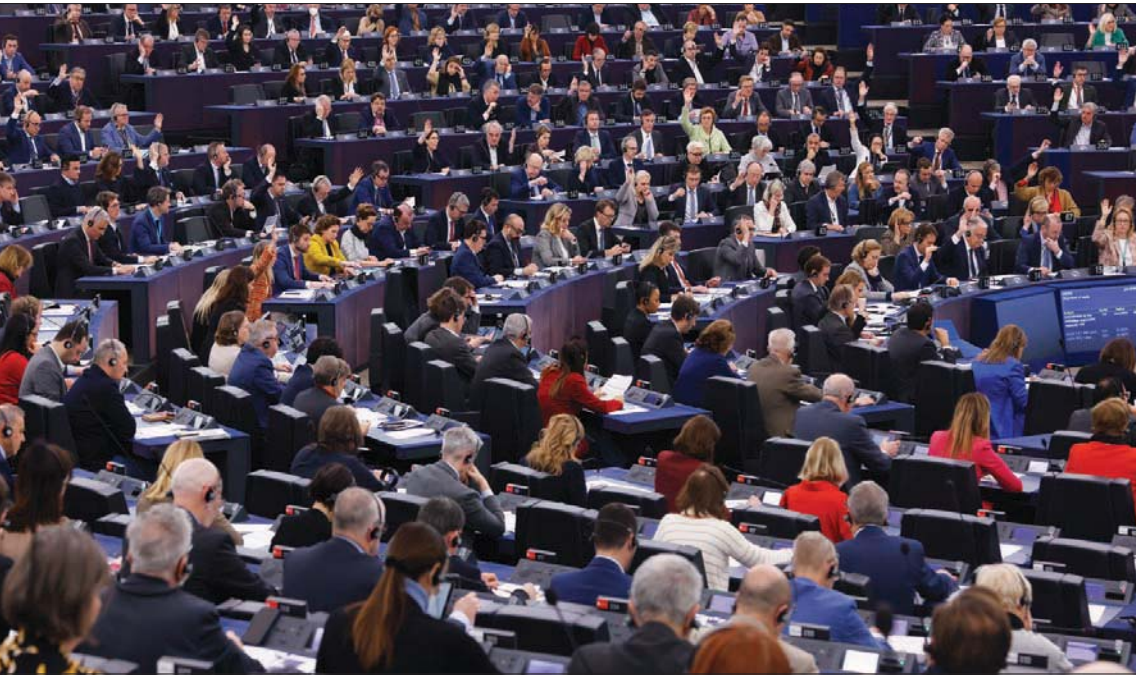
جلسة من جلسات البرلمان الأوروبي