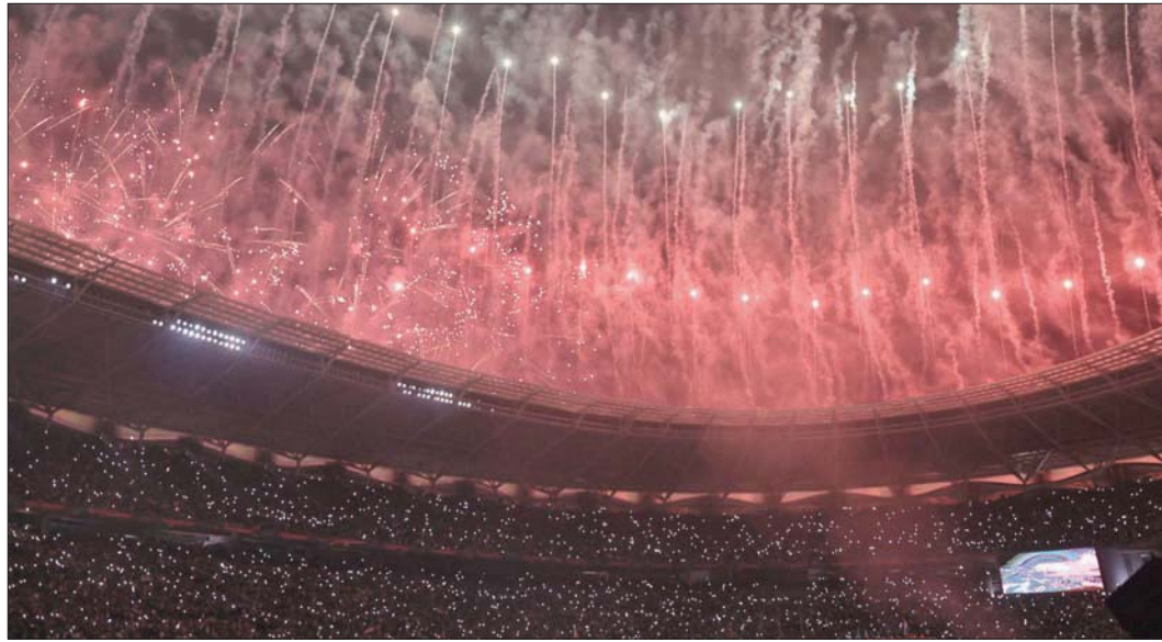
الألعاب النارية تضيء سماء ملعب البصرة

محاولات عدة من الفريقين دون جدوى، وحاول المنتخب العماني الحفاظ على مرماه.