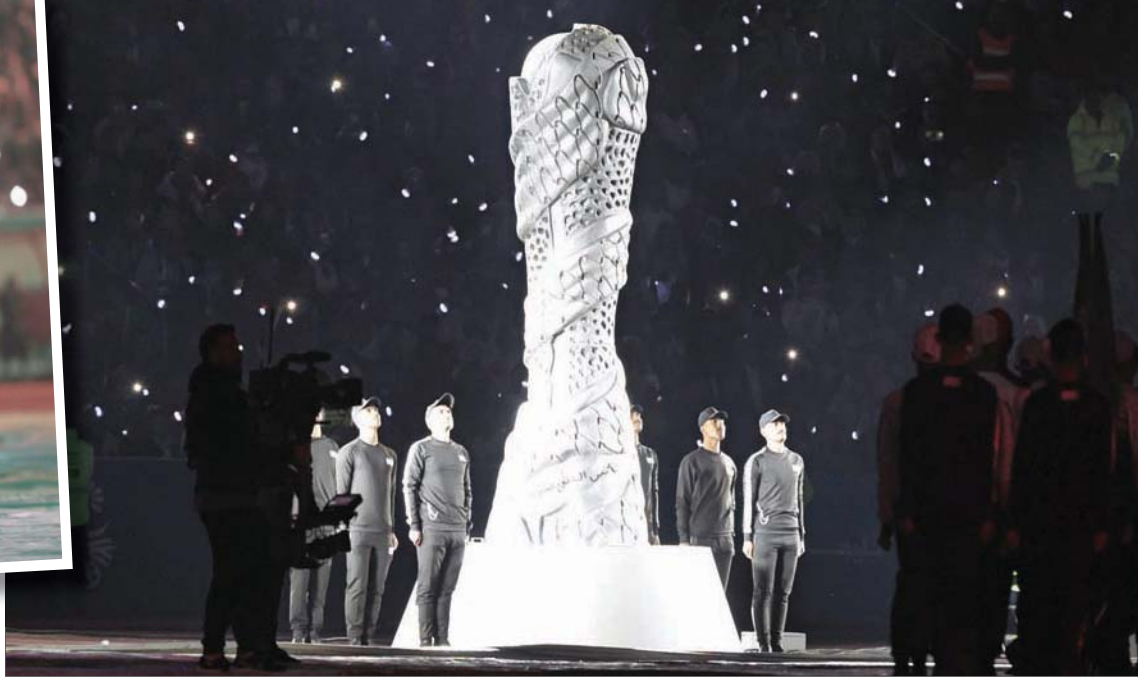
مجسم عملاق لكأس الخليج كما بدأ خلال الافتتاح