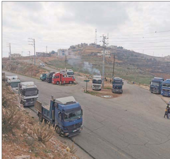
إضراب الشاحنات والحافلات كما تعبر عنه حركة النقل والسير المشلولة

إلا أنه قبل أن يكتب النجاح للتفاوض على حلول وسط لأزمة النقل، اتسعت حلقات الأزمة مع تنفيذ سائقي الحافلات وسيارات الأجرة (التكاسي) العمومية، إضراباً عن العمل في محافظات مادبا والزرقاء والعاصمة. ومن هناك انطلقت الاحتجاجات في محافظتي الكرك والطبيلة و دخلت حين التأثير، بعد انضمام مجموعات شبابية محسوبة على «الحراك» - وهو مصطلح اطلقته السلطات على مجموعات طالبات بإصلاحات شاملة - ما «سحن» المشهد المحلي، وضرب على عصب مؤسسات الدولة الرسمية خشية من توسع الاحتجاجات ورفع سقف مطالباتها، في ظل أزمة اقتصادية مركبة تشهدا البلاد.