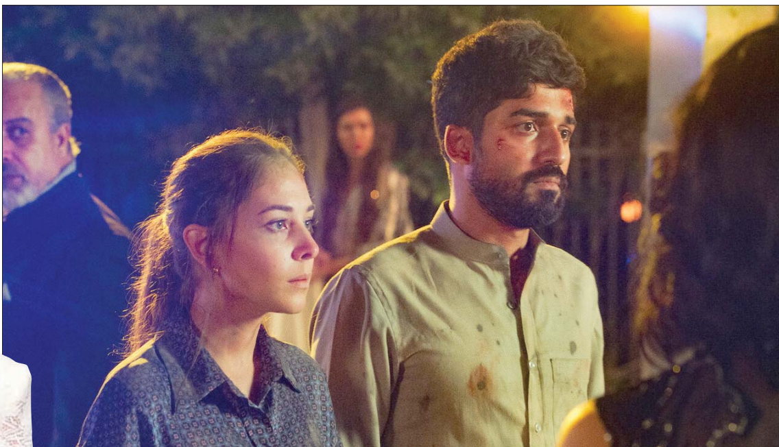
البنوي في لقطة من فيلم «سكة طويلة»

وتأمل المخرجة السعودية أن يكون جمعها بين التأليف والإخراج والتمثيل نقطة قوة لها وليس صراعاً يضعفها: «اعتقد أن ما فعله حالياً نقطة قوة لي وليس صراعاً داخلياً، لأن عملية الإخراج والكاتب تتصارع دائماً مع التمثيل خلال العمل الفني، ولكن حينما تستطيع تحقيق التوازن بينهما سيكون لديك أفضلية، فأنا حينما أجسد دوراً يكون في تفكيري رؤية المخرج الذي يوجهني، وعندما أخرج عملاً أستطيع توظيف توجهاتي للفنان الذي يتلقى مني التوجيهات بشكل سهل وبمبسط لأنني ربما أكون قبلها بيوم مكانه كممثلة أجسد دوراً أمام مخرج آخر، وتنتظر فاطمة عرض فيلمها الجديد «بسة» الذي يعد أول تجربة فنية لها تجمع فيها بين التأليف والإخراج والتمثيل: «لأن منمنغلة في رحلة مطولة مع المونتاج لكي أضع اللمسات الأخيرة على أول فيلم رواثي طويل أخرجه وأمثل فيه».