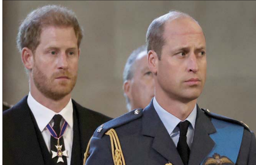
العلاقة بين الأميرين هاري وويليام تحت الأنظار

منذ مغادرتهما، وجّه دوق ودوقة ساسكس، كما