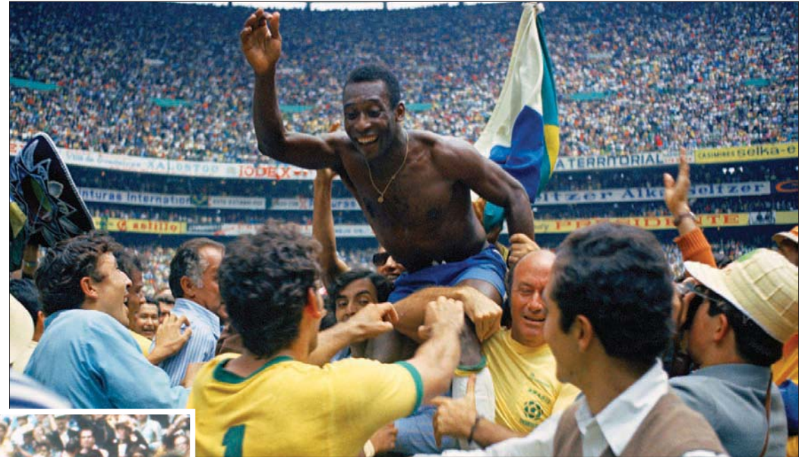
بيليه محمولاً على الأعتاق بعد التتويج بكأس العالم 1970

البرازيل لراقصي السامبا في أي منهما. وفي عام 1966، أصبحت لقطاته الشهيرة وهو يخرج من ملعب «غوديسون بارك» محبباً بعد الهزيمة أولاً من بلغاريا ثم من البرتغال والخروج من كأس العالم، رمزاً للتحويل الجديد الذي طرأ على عالم كرة القدم. فبعدما نجحت البرازيل في حصد لقب بطولتي 1958 و1962 بفضل المهارات الفردية للاعبين (مدعومة ببعض الخطط التكتيكية والدفاع بشكل جيد واللعب بأربعة لاعبين في الخط الخلفي)، فاز المنتخب الإنجليزي بمونديال 1966 بفضل اعتماده على القوة البدنية والتنظيم الكبير داخل الملعب، والضغوط المتواصل على الفريق المنافس. وكان مونديال المكسيك في عام 1970 أول بطولة لكأس العالم تبث عبر الأقمار الصناعية وبالألوان. وكان هناك شعور بالسحر والمتعة وأنت تشاهد المصنمات الصفراء لراقصي السامبا وهي تتلألأ تحت أشعة الشمس المكسيكية. وبدا كل شيء حديثاً بشكل مثير للإعجاب، واطلق على الكرة التي لعبت بها البطولة اسم «تيلستار» على اسم القمر الصناعي.