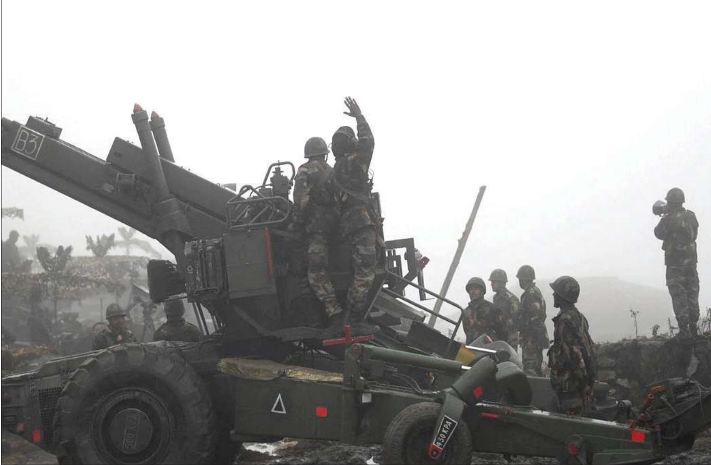
لقطة من الاشتباك الحدودي الأخير في تاوانغ

التخائي إلى التعاون المتعدد الأطراف في إطار شراكة (كواد)، تقدم نيو دلهي يد العون لواشنطن في استراتيجيتها بمنطقة المحيطين الهندي والهادئ لاحتواء الصين، وأصبحت شريكاً محورياً لواشنطن بهذا الأمر. ويضيف: من ثم «زاد موقف بكين العدائي تجاه الهند من أهمية العامل الأمريكي، وباتت نيودلهي الآن أكثر استعداداً لتلقي دعم واشنطن بهدف تحقيق التوازن في مواجهة بكين. الأمر الذي اتضح في التسامح الذي أظهرته نيودلهي تجاه الوجود الأمريكي في مناطق تجاورها مباشرة». وحقاً، منذ إقرار نيو دلهي إلى حد كبير رؤية المحيطين الهندي والهادئ في توجيهها الاستراتيجي، ظهر العداء الصيني في تشكيل تكوينات جيوسياسية في جنوب آسيا. وللمعلم، انضمت الهند إلى القوات البحرية التابعة لدول مجموعة «كواد» في مناورة «سالابار» البحرية المتقدمة في بحر اليابان، نوفمبر 2022. كذلك نفذ الجيشان الهندي والأميركي مناورات عسكرية في أولي بولاية أوتارخاند الهندية، على بعد نحو 100 كيلومتر من «خط السيطرة الفعلية»، وهو ما اعتبره الصينيون تجاوزاً للخط الأحمر الدبلوماسي والعسكري. وثمة أمثلة أخرى على تحفظ بكين على مساعي نيو دلهي لتعزيز علاقاتها مع واشنطن.