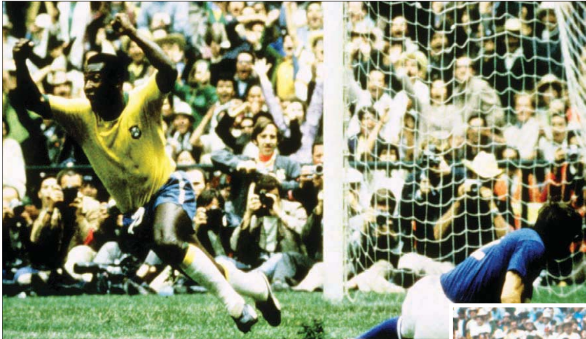
بيليه يحتفل بتسجيل هدف البرازيل الأول بمرمى إيطاليا بمونديال 1970