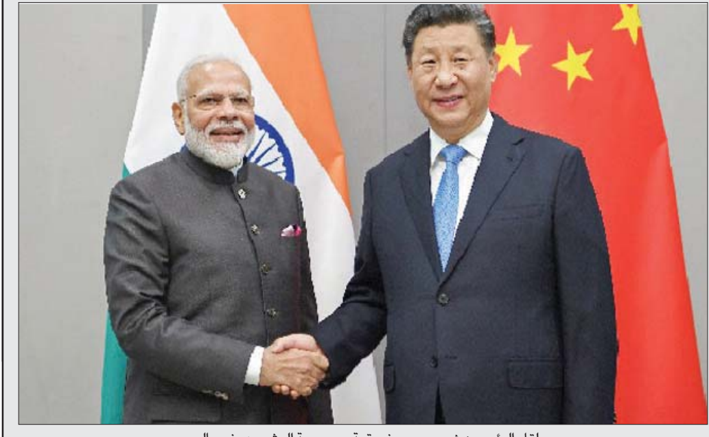
لقاء الرئيسين شي ومودي في قمة «مجموعة العشرين» في بالي

حول الوضع الحدودي بين العملاقين الآسيويين والعالميين، صدرت دراسة حديثة بعنوان «التوتر المتزايد في جبال الهيمالايا... تحليل جغرافي - مكاني للتوغلات الصينية الحدودية داخل الهند». قالت الدراسة، التي أعدها باحثون في جامعة نورثوسترن الأمريكية وجامعة ديلفت للتكنولوجيا في هولندا وأكاديمية الدفاع الهولندية، إن «الغارات الصينية عبر حدود الهند الغربية والوسطى ليست حوادث عشوائية تقع عن طريق الخطأ، بل تشكل هذه التوغلات جزءاً من جهد منسق ومخطط استراتيجياً لفرض السيطرة الدائمة على المناطق الحدودية المتنازع عليها». وفي إطار الدراسة، التي جمع باحثوها معطيات جديدة ومعلومات حول التوغلات الصينية في الهند بين عامي 2006 و 2020، ذكر كبير الخبير وسنكيانغ.