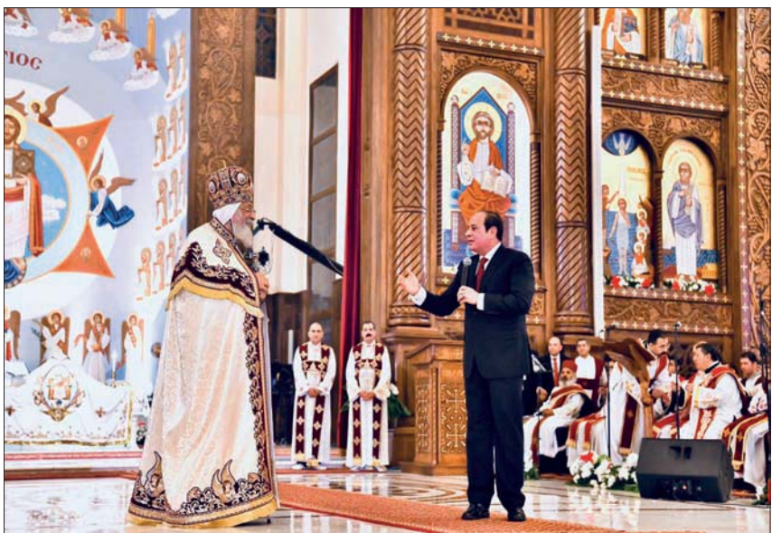
السياسي خلال زيارته لكاتدرائية «ميلاد المسيح» بالعاصمة الإدارية لتقديم التهنئة للمسيحيين

البابا تواضروس الثاني، والمسيحيين المصريين بالعيد. وأكد السيسي، في كلمة له حينها أن «الجمهورية الجديدة» هي جمهورية الحلم والأمل والعلم والعمل، ولا بد أن تكون جميعاً على قلب رجل واحد». وتوسع كاتدرائية «ميلاد المسيح» بالعاصمة الإدارية 8200 فرد، وهي عبارة عن طابق أرضي وصحن ومنازة بارتفاع 60 متراً... وتقع العاصمة الجديدة على بعد 75 كيلومتراً تقريباً شرق القاهرة، وكان السيسي، قد افتتح مسجد «الفتح العليم» وكنيسة «ميلاد المسيح»، في العاصمة الجديدة، عشية احتفال المسيحيين بـ«عيد الميلاد» في يناير عام 2019 في «رسالة رمزية للتسامح في البلد الذي يشكل المسلمون أغلبية سكانية، بنحو 90 في المائة».