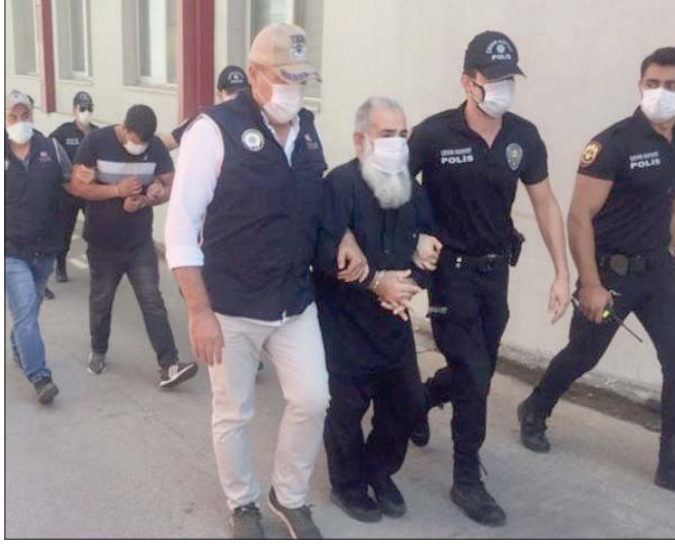
الأمن التركي يشن حملات مكثفة على خلايا «داعش»

وتضاعفت الهجمات التي تشنها جماعات مرتبطة بتنظيمي «داعش» و«القاعدة» في بوركينافاسو منذ عام 2015، وأدت إلى مقتل الآلاف ونزوح مليون شخص على الأقل. وفي نوفمبر (تشرين الثاني) الماضي، أطلقت السلطات في بوركينافاسو حملة لتجنيد 50 ألف شخص على مؤسسات في مدن الإرهابية ونجحت الحملة في تجنيد 90 ألف مواطن. وترى لييام كجار المحللة في مشروع التهديدات الحرجة التابع