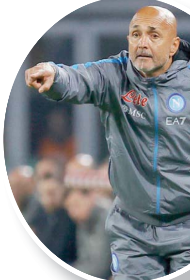
سباليطي طالب لاعبي نابولي بانتفاضة سريعة ضد سمبدوريا

في المقابل، سيجرح برشلونة من خدمات هدافه البولندي روبرت ليفاندوفسكي بعد أن تمنت المحكمة الإدارية الرياضية عقوبته بالإيقاف ثلاث مباريات بعد طرده