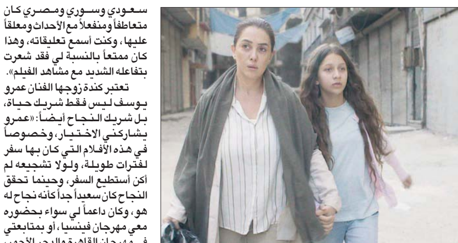
لقطة من فيلم نزوح

سعودي وسوري ومصري كان متعاطفاً ومنفصلاً مع الأحداث ومعلقاً عليها، وكنت أسمع تعليقاته، وهذا كان ممتعاً بالنسبة لي فقد شعرت بتعاطفه الشديد مع مشاهد الفيلم». تعتبر كندة زوجها الفنان عمرو يوسف ليس فقط شريك حياة، بل شريك النجاح أيضاً: «عمرو يشاركني الاختيار، وخصوصاً في هذه الأفلام التي كان بها سفر لفترات طويلة، ولولا تشجيعه لم أكن أستطيع السفر، وحينما تحقق النجاح كان سعيداً جداً كأنه نجاح له هو، وكان داعماً لي سواء بحضوره معي مهرجان فينسيا، أو بتابعتي في مهرجان القاهرة والبحر الأحمر، ولا شك أن دعمه يضاعف سعادتني