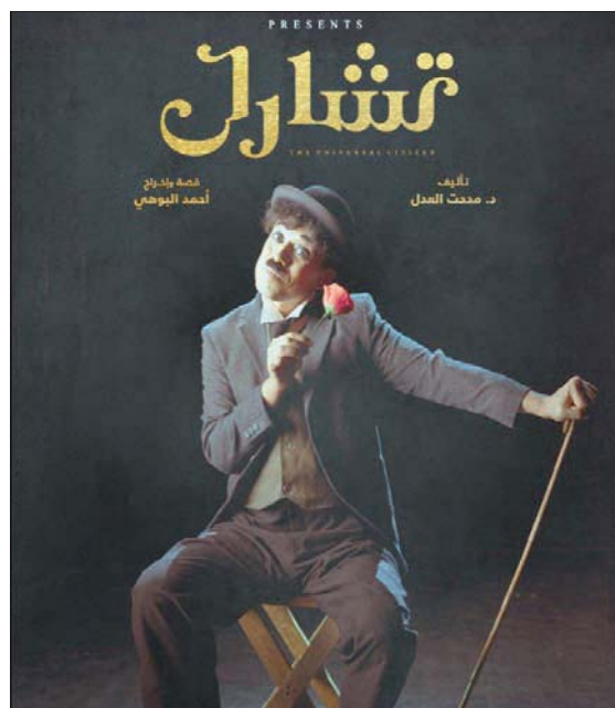
ملصق المسرحية (الشرق الأوسط)

وقدم عروضاً في (بردواي)، ومع الفنان الشاب محمد فهميم بطل العرض، لنقدم عرضاً موسيقياً عن شارلي شابيلن، ونحتمس له صاحبنا (سي سينما)، أحمد فهمي وهاني نجيب، اللذان قاما بإنتاجه، ولم يبخلا على العرض بأي شيء، مثلاً التوزيع الموسيقي لنادر حمدي قام بتسجيله في باريس ومقدونيا من خلال (أوركسترا باريس السيمفوني)، وكنت قد طرحت فكرة العرض منذ عام خلال تقديمي لمحاضرات في السيناريو بالملكة العربية