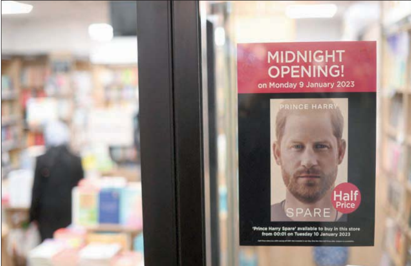
إعلان عن كتاب الأمير هاري في إحدى دور بيع الكتب في لندن

ونقل هاري عن والده قوله: «أرجوكم يا ولدي، لا تجعلنا سنواتي الأخيرة بائسة».