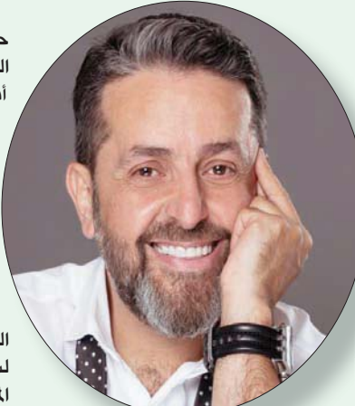
بيروت، فيضيان حداد

وعن اللفتة التكريمية التي شهدتها حفل «تريو نايت» بخصوص الراحل وديع الصافي عندما تشارك المطربين جميعاً في أداء أغنيته «عندك بحرية يا رئيس» يرد: «الأغنية المختارة بحد ذاتها تجمع ثلاثة عمالقة في الموسيقى، فهي من الحان محمد عبد الوهاب وتوزيع إلياس الرجباني وغناء وديع الصافي. فجاءت لتؤكد أن زمن عملاقة الفن لا يموت». واعتبر العليا أن مفاجأة الحفل، التي تمثلت في استضافة المطرب جورج وسوف، كانت حركة رائدة من قبل منظمي الحفل. وتابع: «كانت بمفاجأة لفئة تكريمية لسلمان الطرب، والنجوم جميعاً رغبوا في المشاركة فيها. جورج وسوف أسطورة فنية لن تنسى، وله تاريخه الطويل والعريق في الغناء الطربي، ومن الطبيعي أن يكرم بهذه الطريقة، وهو حدث بحد ذاته، إذ لا يمكن أن يحصل دائماً».