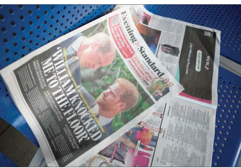
مذكرات الأمير هاري في الصحف البريطانية

تحققت عدة مرات، وبنفس سرعة السيارة التي كانت تستقلها، بحثاً عن إجابات وتساؤلات