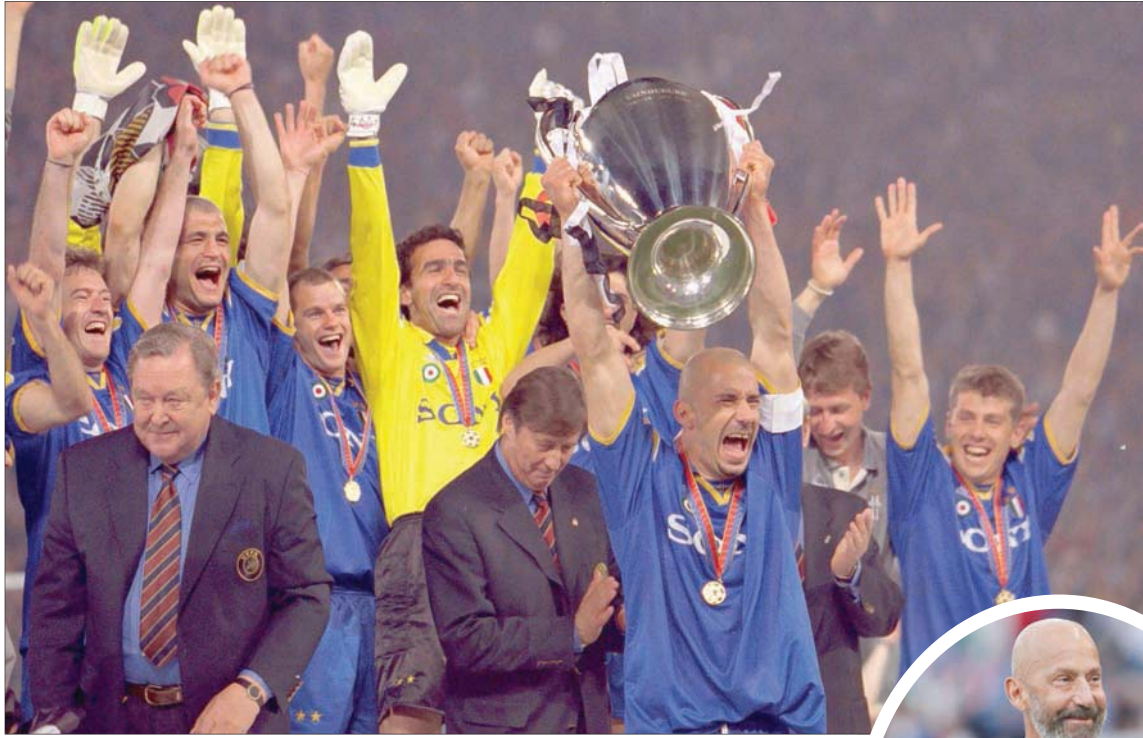
فيالي يرفع كأس أبطال أوروبا مع يوفنتوس عام 1996

وأضاف: «يمكن للمرض أن يعلم الإنسان الكثير عن نفسه، ويمكن أن يدفعه لتخطي طريقة الحياة السطحية التي نعيشها». واضطر فيالي للاعتذار عن منصبه بالاتحاد الإيطالي كرئيس بعتة، الشهر الماضي، قائلاً إنه يحتاج للتركيز في مواجهة مرحلة جديدة من المرض. وعمل مع منتخب إيطاليا، واستعاد التعاون مع روبرتو مانشيني مدرب المنتخب