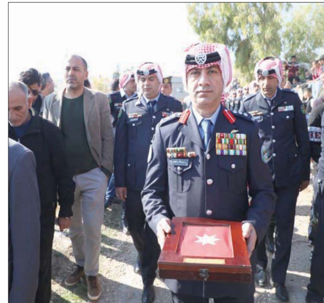
من تشييع العميد الدلايخ

سياسي أسفرت عن إجراء انتخابات وصفت بـ «الأزهر» في تاريخ البلاد، وأنشجت مجلس نواب تقاسمته القوى السياسية اليمينية واليسارية وتيار المحافظين. وهو المجلس الذي ما زال الأردن يستعين بنخبه في المواقع المتقدمة، وعند طلب النصح والمشورة.