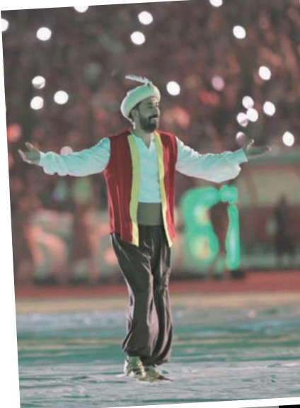
شخصية السندباد اختيرت أيقونة للبطولة العربية