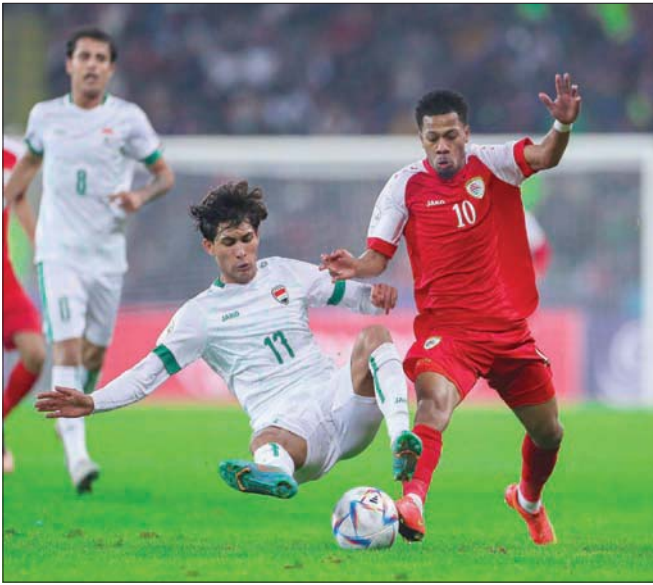
من المواجهة التي جمعت العراق وعمان أمس