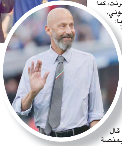
فيالي في ظهوره الأخير خلال عمله مع منتخب إيطاليا

وفدائه المقرب منذ اللعب مع في سمبدوريا، وكان يطلق عليهما «توام الأهداف».