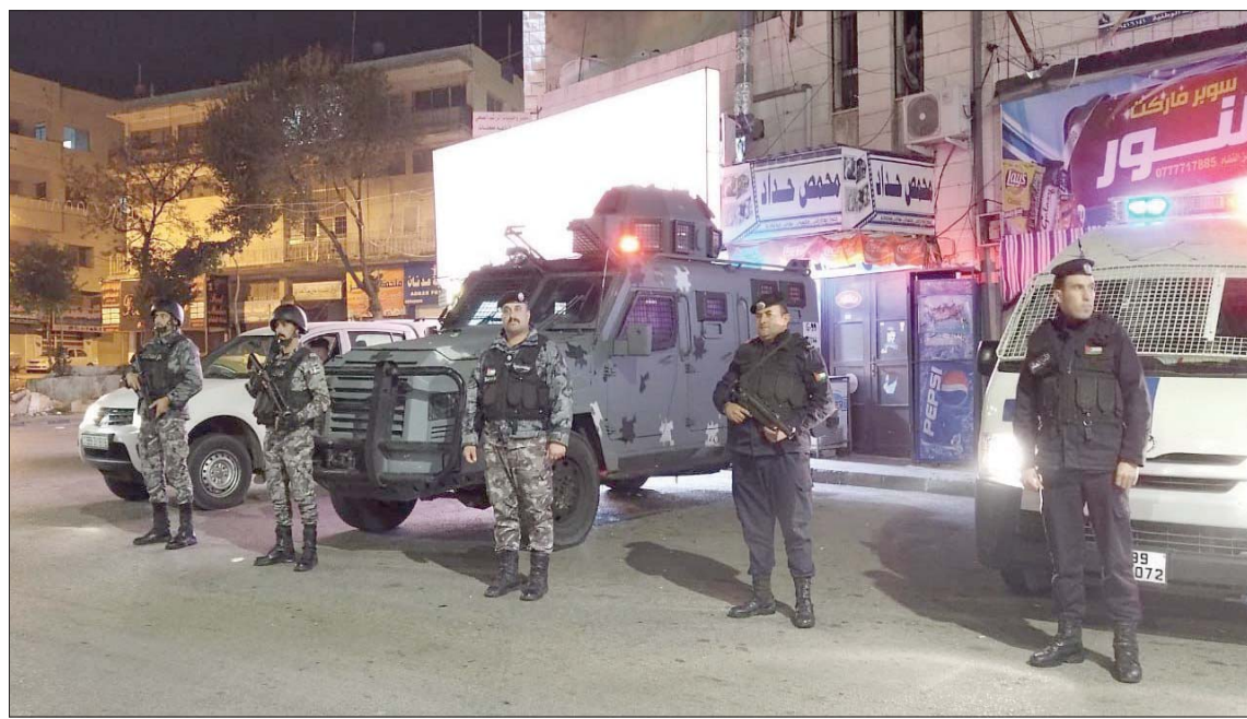
إجراءات أمنية مشددة

قد أفادت «الشرق الأوسط» في وقت سابق، بأن عدداً من المنتمين إلى «التيارات التكفيرية» - أو ما كان يعرف «سجناء التنظيمات» - انهموا مُد مذمومياتهم في السجن الأردني، وعادوا إلى بيئاتهم، ولكن مع ترجيح عودة تواصلهم مع تنظيمات خارجية. ثم إن هذه الخلية زُمدت اتصالات لها مع خلايا تابعة لـ «تنظيم داعش» الإرهابي في الخارج منذ مدة، في وقت كانت هناك جمع معلومات عن حجم الخلية ومدى جاهزيتها لتنفيذ أعمال تخريبية. وبطبيعة الحال، يتحاز مراقبون إلى اعتبار أن الأزمة الاقتصادية تشكل «غطاء» يعزز حراك الخلايا الإرهابية النائمة في بلد سجل معدل البطالة في الربع الثاني فيه من العام الحالي 22,6 في المائة، واقتربت نسبة التضخم من حاجز 5 في المائة حتى نوفمبر (تشرين الثاني) المنصرم. وبالنسبة لأسعار المحروقات (الوقود)، قدرت زيادات أسعارها خلال سنتين فقط بـ 16 في المائة، وجاء ارتفاع سعر مادة الديزل (السولار) للمرة الأولى متجاوزاً سعر بقية المشتقات النفطية، وبعُد المناطق الجنوبية من المناطق الأكثر معاناة تنموياً