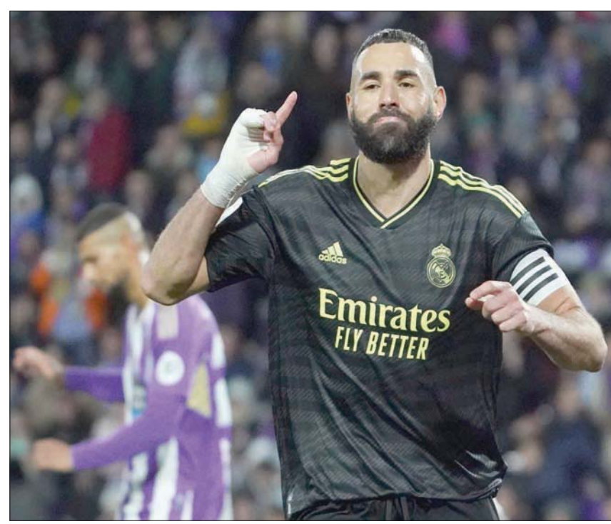
بنزيمة يعود لتدعيم هجوم ريال مدريد (أ.غ.ب)

ويعدول مدرب أتلتيكو الأرجنتيني دييغو سيميوني على مهاجمه الفرنسي أنطوان غريزمان الذي دافع عن ألوان برشلونة لفترة