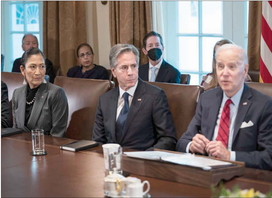
بايدن وإلى يمينه بليتنك ووزيرة الداخلية الأمريكية ديب هالاند في البيت الأبيض يوم الخميس

القدس» التي تشرف عليها وزارة الدفاع ولوجيستيات القوات المسلحة الإيرانية و«الحرس الثوري» الإيراني. وهي تصمم وتصنع مسيرات من طراز «مهاجر 6» التي تستخدمها روسيا في أوكرانيا. وأوضحت أن الاسم لتصميم وتصنيع الطائرات الخفيفة.