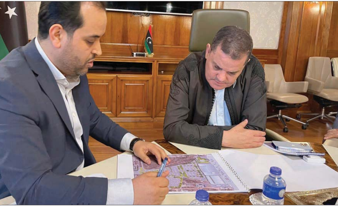
الديبية يتابع مشاريع في مطار طرابلس (حكومة الوحدة المؤقتة)

ولفت المصدر إلى أن «المشري اتجه للقاء عقيلة خارج ليبيا دون عرض ذلك على جلساته للتصويت، بينما كانت هناك مبادرة لبيبة مطروحة من الرئاسي، وبمشاركة الأمم المتحدة في غدامس». في شأن آخر، التزمت حكومة «الوحدة» المؤقتة، برئاسة عبد الحيدى الصلاحية والأهلية»، تأكيد مصادر محلية وإعلامية، مقتل شخص في اشتباكات بالأسلحة الموسطة والثقيلة في منطقة المحمر بمدينة العجيلات، الواقعة على بُعد 80 كيلومتراً غرب العاصمة طرابلس.