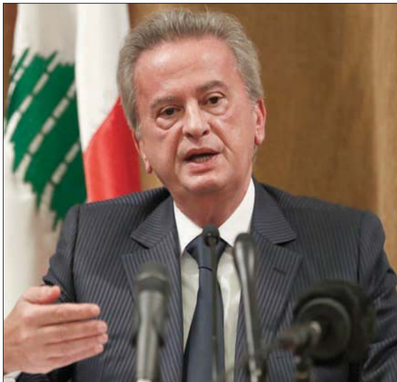
حاكم «المركزي» اللبناني رياض سلامة في مؤتمر صحفي في نوفمبر 2019

وسيمت التعاون مجدداً مع أي تحقيق خارجي في الملفات المالية، وتحديد مصادر الأموال المحولة من لبنان إلى الخارج». وشدد على أن «القضاء اللبناني معني أكثر من القضاء الأوروبي بمعرفة طبيعة تحويل الأموال، وما إذا كانت شرعية أو هي عائدة للخزينة اللبنانية، لكن بشرط سلوك الإجراءات الصحيحة التي تراعي سيادة لبنان واحترام مؤسساته». واعتبر أن «النتائج التي ستنتهي إليها التحقيقات ستخدم مسار التحقيق الذي يجريه القضاء اللبناني؛ لأنه سيطلع على كل المعلومات المتوفرة للقضاء الأوروبي، وسيبنى عليها إجراءاته في المرحلة اللاحقة».