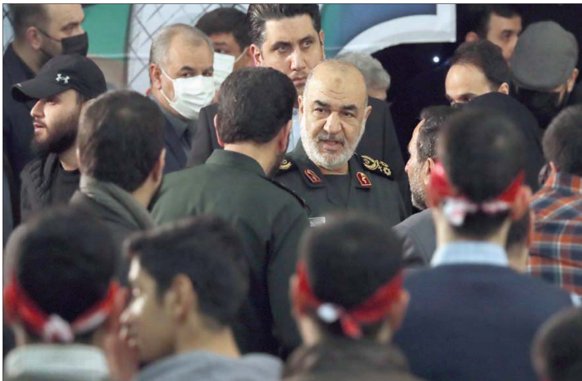
قائد «الحرس الثوري» حسين سلامي في يوم الذكرى الثالثة لسلفه قاسم سليمانى

الجنرال في غارة شنتها طائرة أميركية من دون طيار. بحدوده قال «مركز حقوق الإنسان في إيران» ومقره في نيويورك، إن «الشيف والمؤثر نواب إبراهيمي اعتقل في طهران». مستخدمو وسائل التواصل الاجتماعي يطرحون فرضية أن اعتقاله مرتبط بشرحه عبر «إنستغرام» طريقة تحضير طبق الكباب التقليدي. ولم تقدم المنظمة الحقوقية غير الحكومية أي تفاصيل أخرى بخصوص هذه الوصفة، كما أن حساب إبراهيمي على «إنستغرام» لم يعد متاحاً للاطلاع على الفيديو المشار إليه.