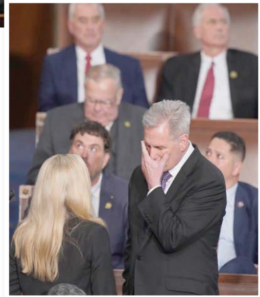
النائب كليفين مكارثي يخاطب النائبة ماجوري تابلور غرين في مجلس النواب يوم الأربعاء (أ.ب)

أحيا الأميركيون، الجمعة، ذكرى اقتحام الكابيتول وسط انقسامات حزبية حادة ختمت على غرف المبنى نفسه الذي شهد اعتداء السادس من يناير (كانون الثاني) 2021. وفيما لا يزال الجمهوريون منقسمين حول اختيار رئيس لمجلس النواب، اختار الرئيس الأميركي جو بايدن إحياء الذكرى الثانية للاقتحام في البيت الأبيض، بدلاً من مبنى الكابيتول الذي زاره العام الماضي في يوم الذكرى.