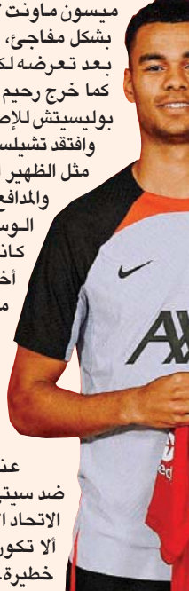
جاكبو ينتظر ظهوره لأول مرة لليفربول اليوم