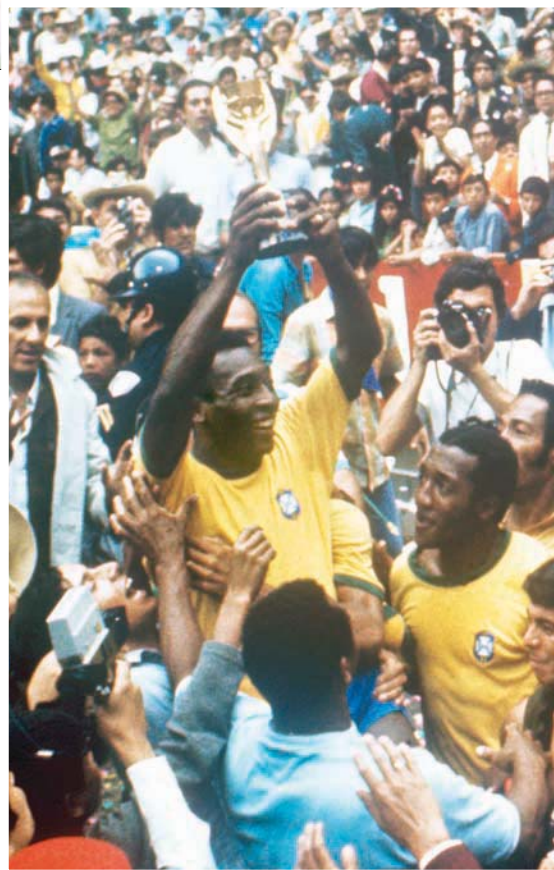
بيليه يرفع كأس العالم عام 1970

في مونديال المكسيك، كان بيليه يمثل «خلاصة كرة القدم البرازيلية، وجمالها وسعادتها. لم يكن من الصعب تصديق أنهم بهذا الأداء كانوا متحمسين لأن يقولوا شيئاً عن اللعبة وعن أنفسهم أيضاً». ومع ذلك، تم استغلال هذا التفوق البرازيلي - على الرغم من أن المنتخب البرازيلي نفسه ليس مسؤولاً عن ذلك - لأغراض دعائية من قبل الرئيس البرازيلي الدكتاتور إميليو ميديسي.