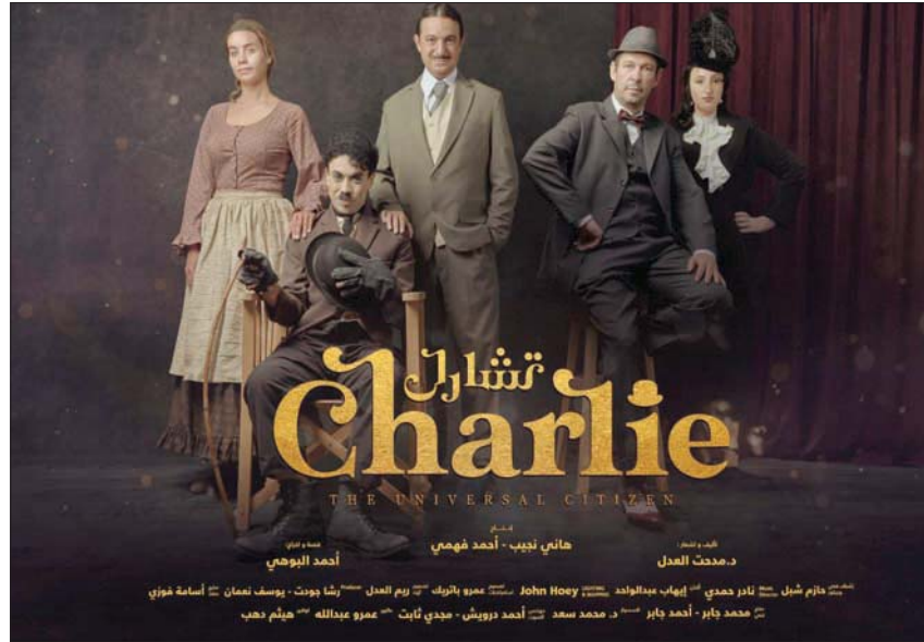
«تشارلي» مسرحية استعراضية غنائية