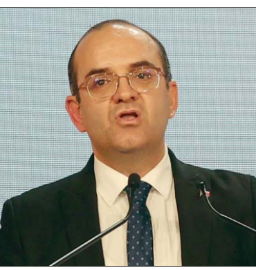
فاروق بوعسكر رئيس الهيئة المستقلة للانتخابات خلال إعلانه نتائج الدور الأول من انتخابات البرلمان التونسي

بالسجن في حال ثبوت ارتكابه جريمة انتخابية، مع حرمانه من الترشح مدى الحياة، وكذا حرمان الناخبين الذين تلقوا أصواتاً من المرشحين من حق الانتخاب لمدة 10 سنوات، على حد قوله. يُذكر أن المحكمة الإدارية التي تنظر في النزاعات المتعلقة بحرق القانون وتجاوز السلطة، تلقت 55 طعناً في الانتخابات، وأصدرت في شأنها 40 حكماً بالسجن شكلياً، و12 حكماً بالحرمان أصلاً، في حين تم قبول 3 طعون، وتعديل نتائج الانتخابات في 3 دوائر انتخابية بكل من بنزرت الجنوبية (بنزرت)، وسليمان (نابل)، وبن عروس المدينة الجديدة (بن عروس).