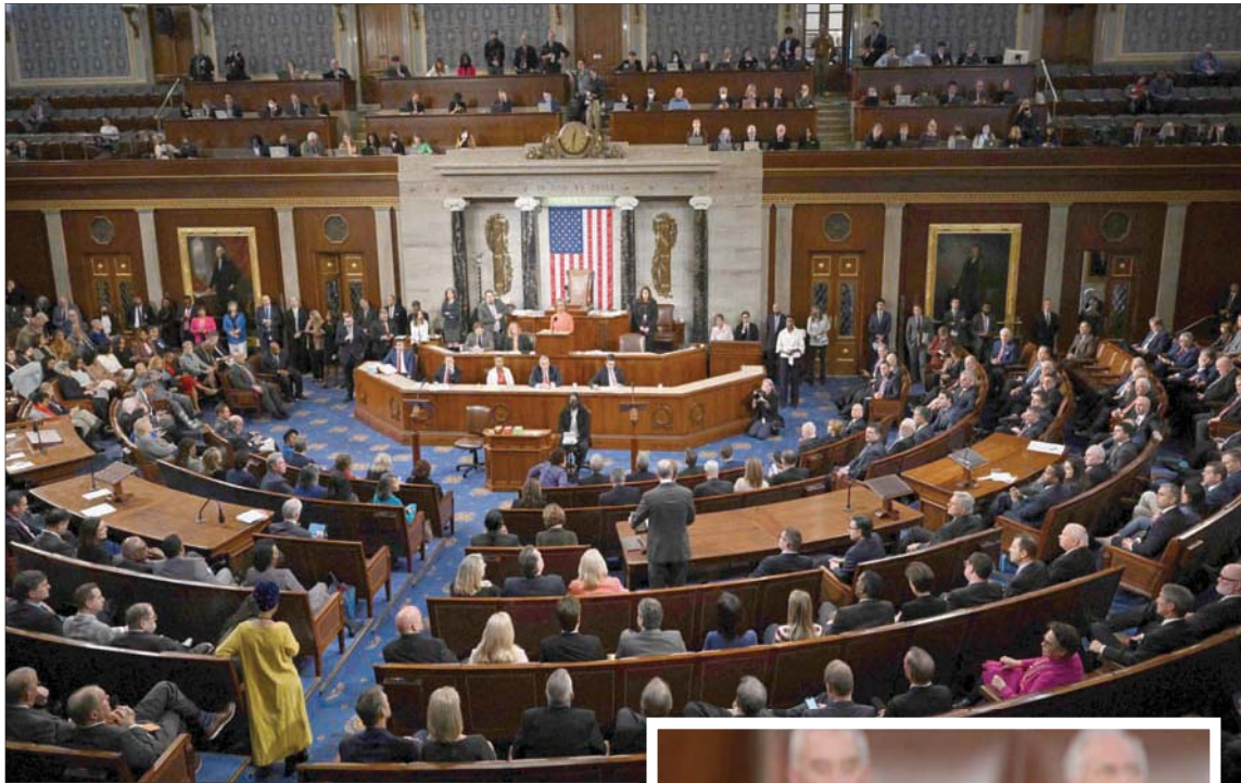
جانب من جلسة تصويت في مجلس النواب الخميس