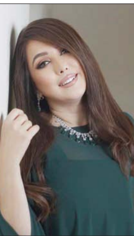
الفنانة السورية كندة علوش

بالنجاح». ويشأن مدى رغبتها جيدة، كما أن الأم في الفيلمين كانت في الواقع صغيرة، لذا لم تلجأ لوضع ماكياج يكبر من شكلنا».