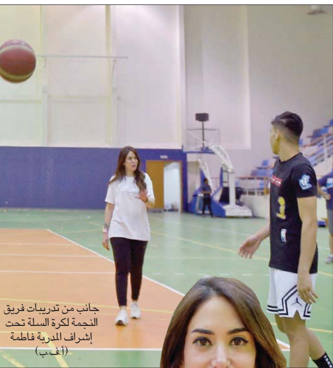
جانب من تدريبات فريق النجمة لكرة السلة تحت إشراف المدربة فاطمة

• هل لديك طموح أكبر من اللاعبين الأجانب للفريق؟ - بكل تأكيد، لدي طموح يكبر يوماً عن آخر... أولاً، أشكر الإدارة وكل منسوبي هذا النادي على منحي هذه الفرصة والثقة التي نلتها، ولا أنسى الاتحاد البحريني ولجنة المديرين وكل من وقف معي، ولدي طموح أن أخدم في مجال في المنتخب الوطني البحريني، وأن أواصل رحلة النجاح العملية في المجال الذي أحبه، وبالعودة إلى المستوى الذي أتىني أن أوفق مع المجموعة في تحقيق الأهداف التي وضعناها وننافس بقوة على المراكز المتقدمة، وأن تكون عند حسن الظن.