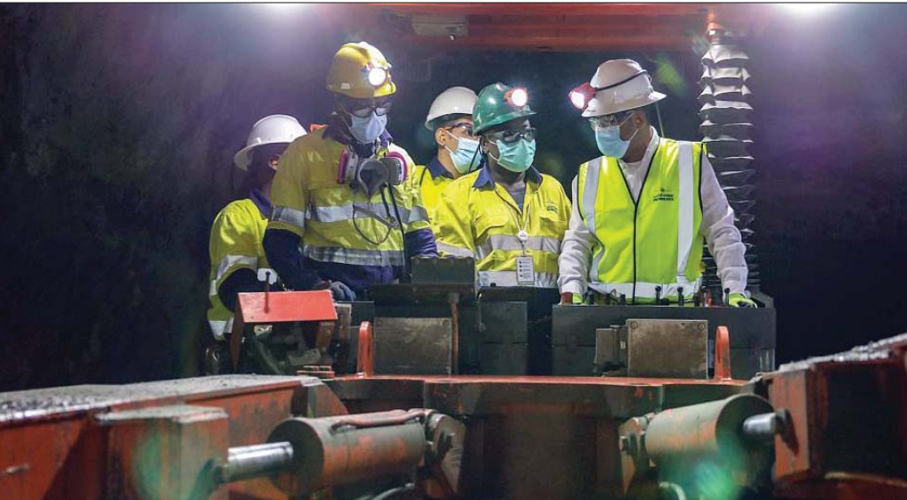
تقرير دولي يقول إن السعودية في وضع قوي يؤهلها لتصبح لاعباً رئيسياً في مجال المعادن المرتبطة بالطاقة المتجددة (الشرق الأوسط)

تغير المناخ؛ من خلال توفير سلاسل إمداد مرنة ومستدامة للمعادن. وأكد تقرير معهد باين أن أي تحول اقتصادي من الوقود الأحفوري إلى الطاقة سوف يستغرق وقتاً ليس بالقصير، وربما يستغرق عقوداً.