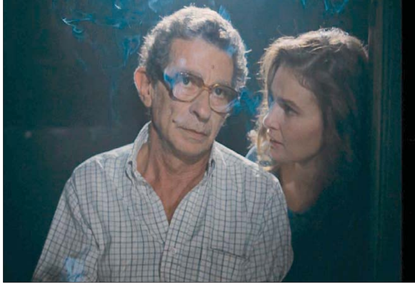
يوسف شاهين الذاتي في «إسكندرية كمان وكمان»

أما فيلم «ذات مرة في هوليوود» (Once Upon a Time in Hollywood) لكوون في تارنتينو فيستدير صوب فترة أخرى منتقلاً إلى الستينات