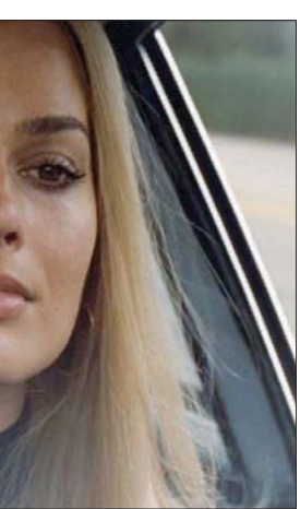
مارغوت روبي لعبت دور شارون تيت في «ذات مرة في هوليوود»

الشخصية. دومينيك هو من ربط، أكثر من سواه وبوضوح كتمثال على الفساد والسقوط الأخلاقي. الفترة التي اختارها شازل هي نهاية العشرينات ومطلع الثلاثينات عندما تهاوت أحلام ممثلين وممثلات فاشلات في التوت من السينما فقلوا في الناطقة، ليس هذا موضوعه الوحيد، بل يشغل نفسه بمواضيع عدة تحت سقف واحد: هوليوود التي كانت، في ذلك الحين، مرتع الشهوات وتداول المنافع الشخصية وتحداياتها ما بين الإدمان على الكحول والإدمان على المخدرات والجنس.