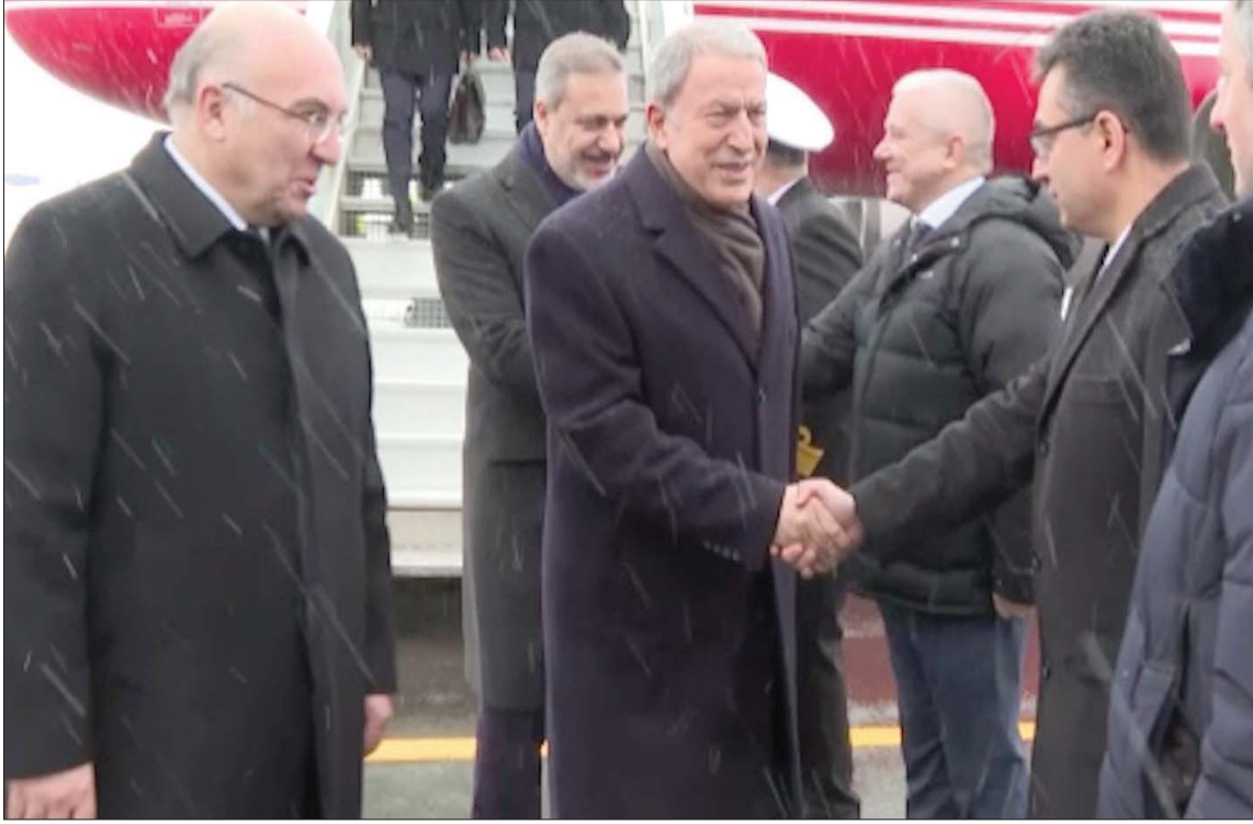
صورة نشرها موقع «آخر خبر» التركي لوزير الدفاع ورئيس المخابرات لدى وصولهما إلى موسكو (الأربعاء)

وأضاف سيراز أن اجتماع موسكو كان تطوراً إيجابياً، ويعني أن هذا الاجتماع يعني أن روسيا اقنعت الأسد بإقامة اتصال مع تركيا، مشيراً إلى أن العملية البرية التي أعلنت عنها تركيا تم تأجيلها. وعبر عن اعتقاده أن العملية لا يمكن إجراؤها إلا بالتنسيق مع سوريا.