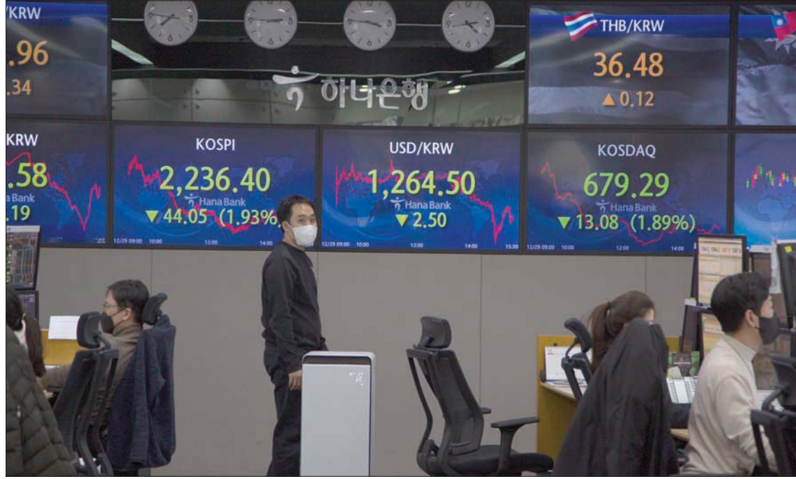
متعاملون في بورصة كوريا الجنوبية

على التوالي بعد انخفاضه 8,6 في المائة في 2021، وتسجيله أكبر تراجع منذ عام 2008.