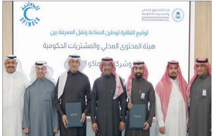
وزير الصناعة والثروة المعدنية يتوسط الحضور أمس خلال حفل إبرام الاتفاقيات توطين الصناعات الدوائية

الشرق الأوسط، تعتزم السعودية توطين بعض الصناعات الدوائية والمستلزمات الطبية، ونقل المعرفة إلى السوق المحلية، وذلك بعد إبرام هيئة المحتوى المحلي والمشتريات الحكومية، أمس (الخميس)، 7 اتفاقيات مع شركات وطنية لتنفيذ المشروع، مع تقديم حوافز معينة عند توطينها، مثل الإدراج في القائمة الإلزامية للمنتجات الوطنية. وتُعد القائمة الإلزامية المتأخر من أن يلتزم مع الجهة الحكومية بشراؤها من مصنعين وطنيين، حيث تهدف إلى تنمية الصناعات والمنتجات المحلية التي لديها القدرة على الوفاء باحتياج المشروعات الحكومية.