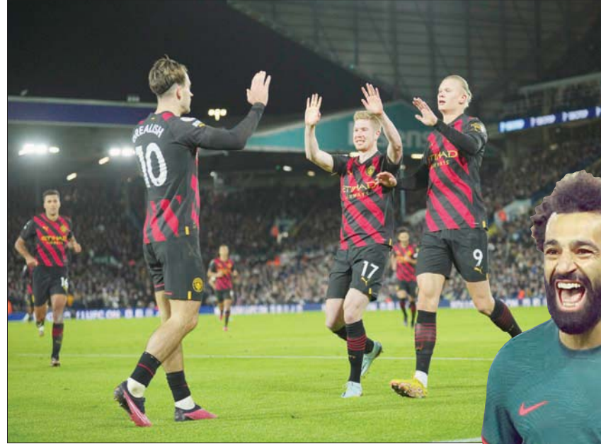
مانشستر سيتي وفرحة الفوز في ليدز

فوزه الكبير على لستر سيتي 3 - صفر في منتصف الأسبوع. وبعدما حقق فوزه الأول في آخر ست مراحل بتغلبه على ضيفه بورنموث 2 - صفر الثلاثاء بفضل هدف وتمريرة حاسمة من الألماني كاي هافيرتز في لقاء خسر خلاله جهود العائد للثمن للإصابة ريس جيمس، يعني تشيلسي ومدربه الجديد غراهام بوتنر النفس بمواصلة الصحوة حين يحتتم النادي اللندني المرحلة الأحد في ضيافة ريسا كانت بداية النصف الأول من الموسم الحالي للدوري الإنجليزي صعبة على فريق ليفربول لكن بإمكانه أن ينهي عام 2022 بأفضل صورة ممكنة إذا فاز على لستر سيتي. ورغم أن تحقيق الفوز على أستون فيلا لم يؤثر على ترتيب الفريق فإنه رفع