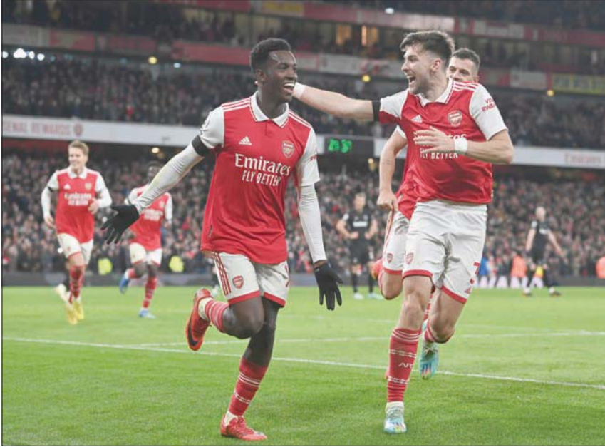
أرسنال يتخطى وستهم ويواصل تغريده منفرداً في الصدارة

ويعتقد روجرز أن المباراة أمام ليفربول، تمثل «فرصة عظيمة» لفريقه للعودة لطريق الانتصارات بعد الخسارة أمام نيوكاسل. وقبل العطلة الشتوية، كان لستر يقدم عروضاً مميزة وحقق أربعة انتصارات من خمس مباريات، ولكنه خسر 3 أمام نيوكاسل، وجاءت الأهداف الثلاثة في أول 32 دقيقة من المباراة. وقال روجرز في مؤتمر صحافي الخميس: «أعتقد أن أول 20 دقيقة في أنفيلد دائماً ما تكون مهمة للغاية». وأضاف «مع الجمهور والضغط ونغونا، وهو ما جعله يعتمد على اليكس أوكسليد تشامبرلين وأضاف «تحتاج لهذه القدرة، إذا فشلت في أن يكون لديك هذا الإيمان. أعتقد أن في أي مباراة كرة قدم - يكون هناك مباراتان - المباراة نفسها، وقبلها مباراة الإيمان».