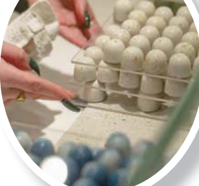
شركة «السلام بالشوكولاته» تشغل نحو 75 شخصاً (نيويورك تايمز)