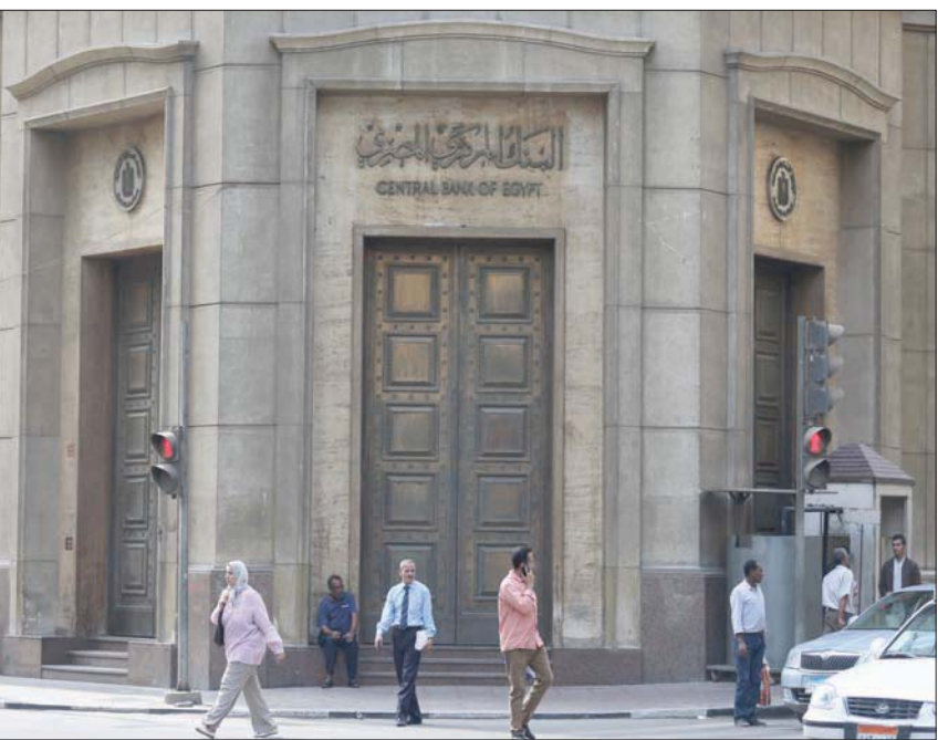
أتاس يمشون أمام مقر البنك المركزي المصري بوسط القاهرة، مصر

المحلية والدولية، ومراعاة الأبعاد الاستراتيجية والأمنية للأنشطة الاقتصادية عند اتخاذ قرارات ملكية الدولة للأصول؛ حيث ستحافظ الدولة على وجودها في عدد من الأنشطة ذات الأولوية وذات البعد الاستراتيجي. كما أشار مديولي إلى أنه من بين الاعتبارات المهمة كذلك استهداف «سياسة ملكية الدولة» لتحسين طريقة تخصيص الموارد الاقتصادية، وتنفيذ تخرج القطاع من الأنشطة والقطاعات المستهدفة، بما يتماشى مع رغبة واستجابة القطاع الخاص الفعلية بالوجود في تلك الأنشطة. وأكد التزام الدولة بمواصلة كافة الإصلاحات التي من شأنها تعزيز وزيادة مستويات جاذبية مناخ الأعمال، إضافة إلى تقييم الأصول المملوكة للدولة استناداً إلى أسس عادلة ومحايدة، وبما يتوافق مع المعايير الدولية لتقييم الأصول، وتحديد منهجية التعامل مع أصولها لتجنب التداعيات غير المواتية، من حيث العادلة، والإيرادات. ولفت إلى أنه تم رسم خريطة وجود الدولة على مستوى الأنشطة الاقتصادية بعدد من القطاعات والصناعات التحولية، بعدد 62 نشاطاً سيتم التخلي عن أو تخفيض الاستثمارات الموجهة لها، و76 نشاطاً سيتم تخفيض أو زيادة الاستثمارات الموجهة لها، مع الإشارة في الوقت ذاته إلى مبررات الدولة من وراء ذلك.