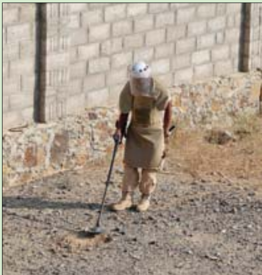
أحد العاملين في مجال نزع الألغام في منطقة الخوخة اليمنية المحررة من الحوثيين جنوب محافظة الحديدة

ودعت اللجنة اليمنية المعنية بالتحقيق في انتهاكات حقوق الإنسان، كافة أطراف النزاع إلى الامتثال للقانون الدولي الإنساني والقانون الدولي لحقوق الإنسان في حماية المدنيين على جميع المناطق اليمنية والامتثال عن الهجمات العشوائية، وإيقاف عمليات الاعتقال التعسفي والإخفاء القسري والتعذيب ونهب الممتلكات، وإلى عدم تقييد عمل المجتمع المدني ومشاركة النساء في الحياة السياسية والاجتماعية والعامه. وحضت اللجنة المجتمع الدولي المعني بملف حقوق الإنسان في اليمن على إدانة انتهاكات حقوق الإنسان وتسمية الطرف المنتهك وعلى زيادة حجم المساعدات الإنسانية لليمن ومساعدة الحكومة الشرعية لليمن لوقف الانتهاكات القانونية.