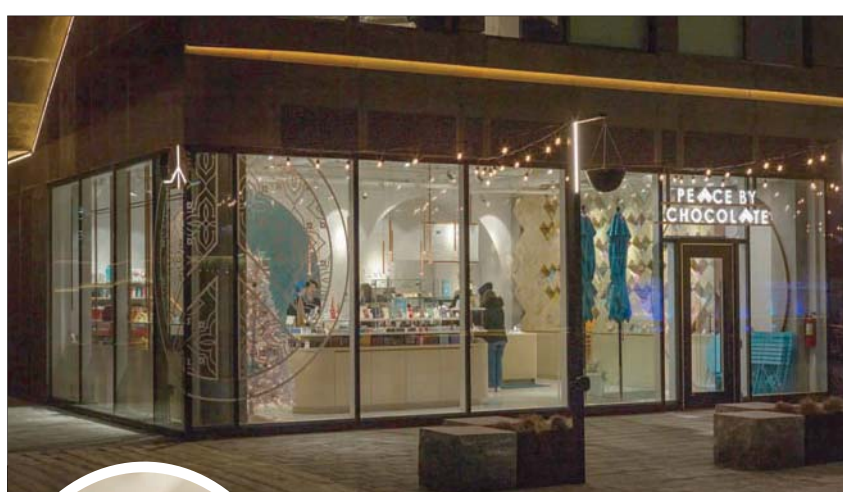
أصبحت قصة عائلة حداد موضوع فيلم وكتاب (نيويورك تايمز)

وكان افتتاحه في ربيع عام 2021 أثناء تفشي الوباء بمثابة