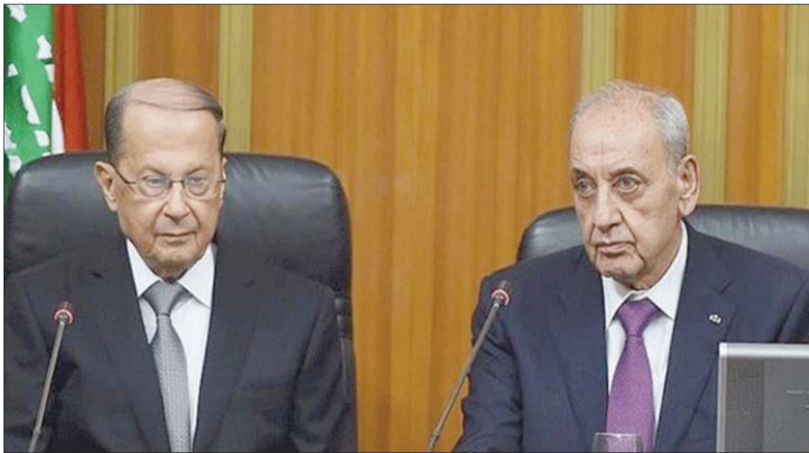
الكيمياء المغقودة تظهر على وجه بري وعون في جلسة انتخاب الأخير قبل 6 سنوات

واستهلّت مسيرة النزاع عام 2009 مع الانتخابات النيابية، حيث لعبت حركة أمل التي برأسها بري مع التيار الوطني الحر دور الحليف والخصم في أن مرشح الآخر وقبته، رئيس حزب المردة سليمان فرنجية. أما خلال مرحلة التفاوض للتوصل إلى إقرار قانون جديد للانتخابات مطلع العام الحالي، فقد اتهم عون بري بطرح مشاريع قوانين لا تراعي التمثيل المسيحي الصحيح وتسهم بسيطرة الطوائف الأخرى على حضورهم الجلسة ورفض وزير مورييس سليم التوقيع عليه بخصامته مع زملائه الوزراء، يعني حتماً بأنه سيبصر إلى ترشيح ترقيتهم إلى الأول من يوليو (تموز) 2023 (أي بعد ستة أشهر)، على أن يُحفظ حقهم في الأقدمية في حال أن تعطلت انتخابات الرئيس لن يتمدد إلى ما بعد هذا التاريخ.