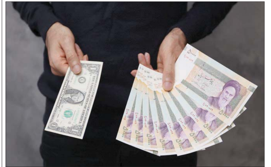
بانع يعرض دولاراً واحداً مقابل 8 أوراق نقدية من فئة 50 ألف ريال بعد انخفاض قياسي للعملة المحلية الأسبوع الماضي

ارتفع عدد السياسيين الألمان الذين يرفعون سجناء سياسيين في إيران، إلى أكثر من 100 نائب، وفقاً لما أكده، لـ «الشرق الأوسط» أحد النواب الذين بدأوا تحرك رعاية السجناء، داخل البرلمان الألماني. وقال النائب كافي منصور، المنتمي للحزب الاشتراكي الديمقراطي الحاكم، في تصريحات، لـ «الشرق الأوسط»، إن نواباً من كل الأحزاب تقريباً انضموا إلى التحرك، من بينهم نواب من الحزب المسيحي الديمقراطي المعارض الذي ينتمي إليه المستشار السابقة أنجيلا ميركل، والذي يوجه انتقادات متكررة للحكومة بسبب سياستها اللينة مع إيران.