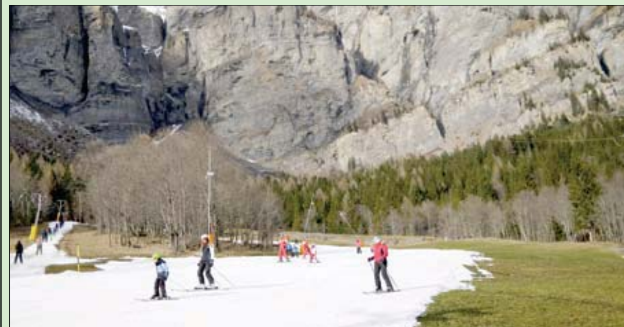
يسرع المتزلجون من منحدر به تلج صناعي في وسط حقل بلا تلوج هذا العام، على ارتفاع 1411 متراً فوق مستوى سطح البحر، في لوكيرباد، بسويسرا. أمس، وأدى الطقس المعتدل في الأيام القليلة الماضية في جبال الألب السويسرية إلى تعطيل النشاط من منتجعات التزلج الألبية على ارتفاع 2200 متر فوق مستوى سطح البحر... وفي الصورة متزلجون في منحدر به تلج صناعي