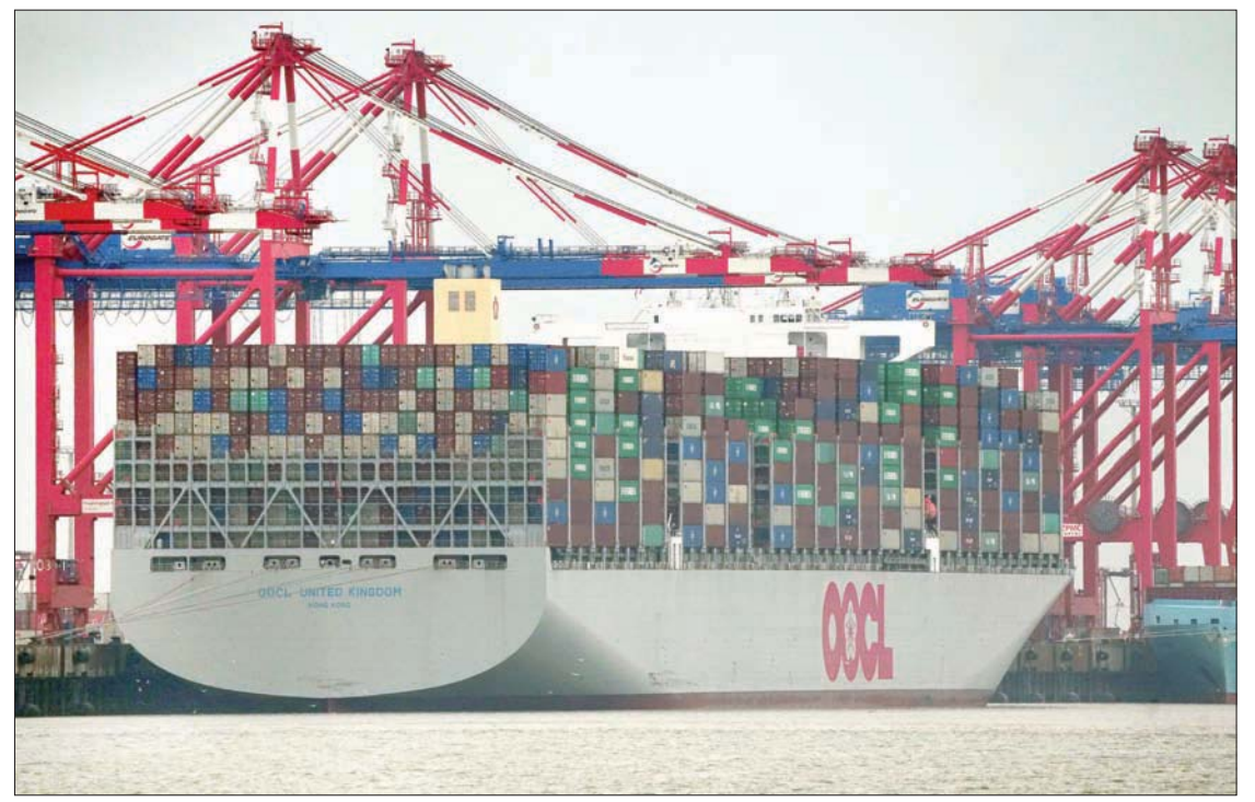
نمو الاقتصاد العالمي في 2022 قدر بنسبة 3,1 % فقط بانخفاض حاد عن 2021 الذي سجل نمو بنسبة 5,9 % (أ.ب)