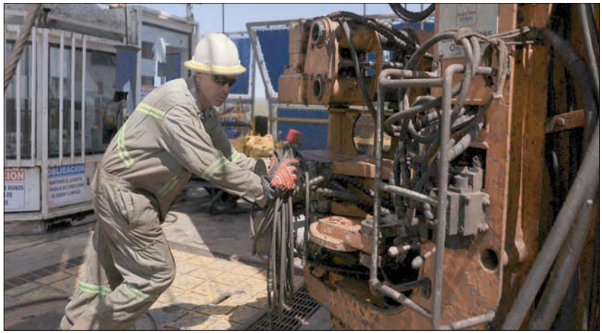
موظف يعمل في منصة حفر في فاكما مويرتا لاستخراج النفط والغاز في الأرجنتين

ويستخدم «البروبان» و«البيوتان»، في صناعة البتروكيماويات، إضافة إلى استخدامات أخرى كوقود الطبخ والتدفئة، وغيرهما من الاستخدامات. وتاثر أسعار الغاز المسال بأسعار النفط في الأسواق العالمية ارتفاعاً وانخفاضاً باعتبارها محدد رئيسياً لأسعار هذه المواد، إضافة إلى تأثيرها بقوى العرض والطلب في السوق وعوامل أخرى.