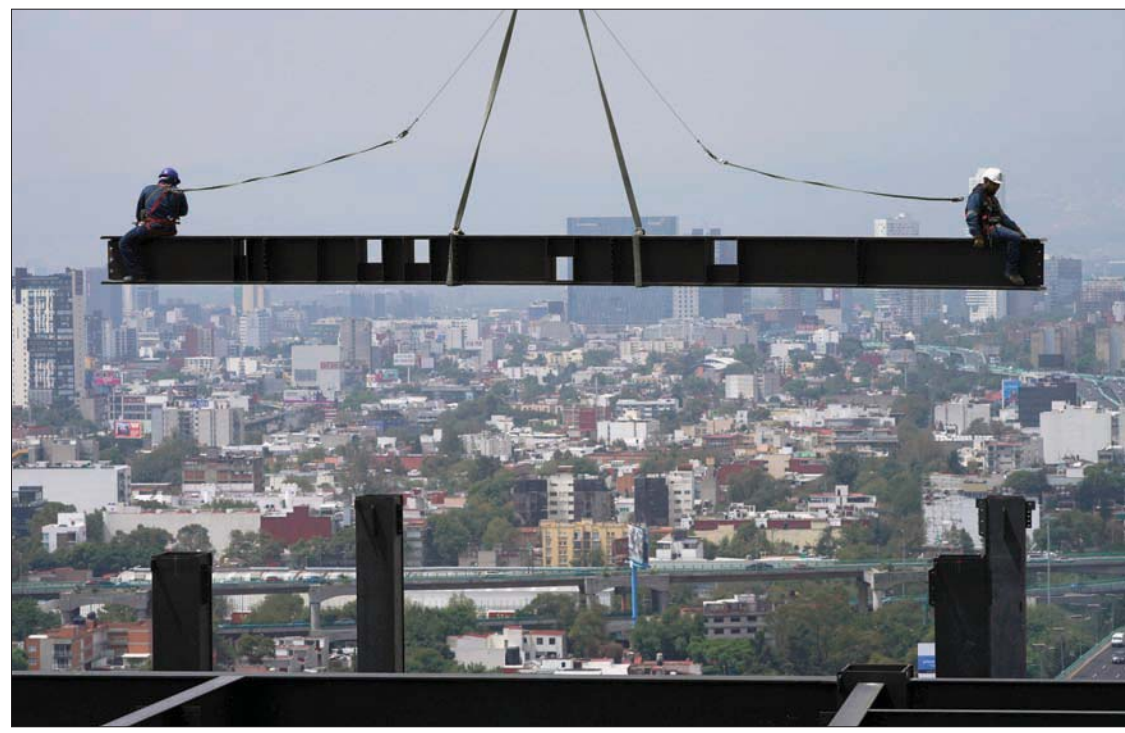
عمال البناء يركبون على عارضة معلقة من رافعة في موقع بناء مبنى سكني شاهق في مكسيكو سيتي