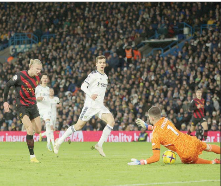
إحدى الفرص الضائعة التي أغضبت غوارديولا من هالاند رغم الثنائية

بنهاية تسرية عن نفوس جماهير ليدز المحبطة. وساعد الفوز سيتي صاحب المركز الثاني على إعادة الفارق إلى خمس نقاط مع أرسنال متصدراً الترتيب، بينما ظل ليدز في المركز الـ15 بفارق نقطتين عن منطقة الهبوط. وقال هالاند «الذي هدف (على صعيد تسجيل الأهداف)، لكن لا يمكنني الإفصاح عنه. قلت للتو داخل غرفة الملابس إنه كان بإمكانني تسجيل خمسة أهداف لكن الشيء الأكثر أهمية هو أننا فزنا. علينا أن نلحق بأرسنال. كان بإمكانني تسجيل هدفين آخرين، لكن هذه هي الحياة ويجب أن أتدرب أكثر». وخسر سيتي آخر مباراة له في الدوري قبل فترة توقف كأس العالم أمام برنتفورد، لكنه سيخسر على مواجهة ليدز، خاصة مع تألق هالاند الذي بدأ الهجوم على مرمى ليدز في الثانية الـ36 من بداية اللقاء، لكن حارس ليدز تصدى لمحاوته.