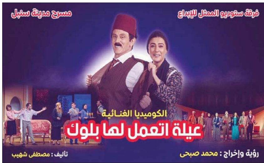
بوستر مسرحية «عيلة اتعمل لها بلوك»

ولفتت الخشاب في تصريحات سابقة لـ«الشرق الأوسط» إلى أنها «لا تشغل نفسها كثيراً بالطريقة التي