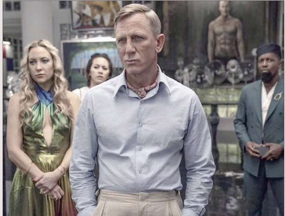
«سكاكين مسلولة 2»

مثل كايت هسدون وكاترين هون، وهؤلاء وسواهم كتبت نابض بالحياة، ربما أكثر من تلك الشخصيات التي ظهرت في «قطار الشرق السريع»، و«موت على النيل» للذين أخرجهما كنيث براناه عن روايتين فلبتتين لأغاثا كريستي.