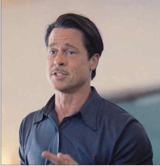
براد بيت كما يظهر في «بابلون»

للأخوين كوون أن تعرضا لهوليوود وبعض عناصر حياتها في «بارتون فينك» (1991) عن ذلك الكاتب النيويوركي الذي انتقل للعمل في هوليوود فوجد نفسه مثل سمكة خارج الماء.