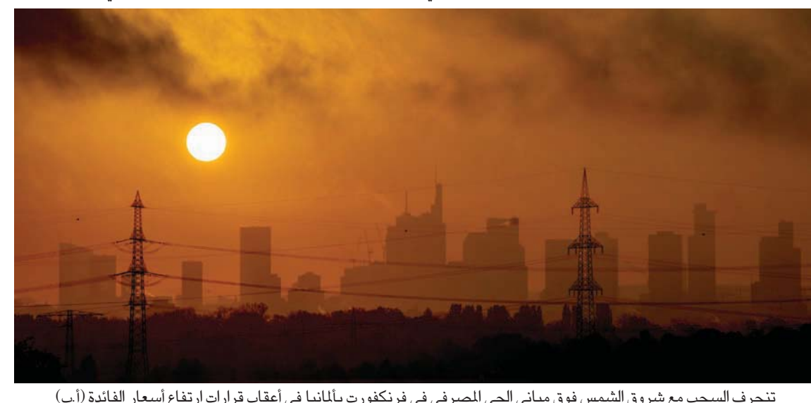
تندرج السحب مع شروق الشمس فوق مباني الحي المصرفي في فرانكفورت بألمانيا في أعقاب قرارات ارتفاع أسعار الفائدة

تقرير حديث لصحيفة «نيويورك تايمز»، ستؤدي نسبة التضخم المرتفعة والنقص في موارد الطاقة في أوروبا إلى انخفاض معدلات الإنتاج. وبالإضافة إلى ذلك، فإن الوضع في سوق العمل سينداد سوءا في منطقة اليورو. وفي دليل على الأجواء الاقتصادية القاتمة، يتجه مؤشر ستاندر أند بورز 500 لأسوأ عام له منذ أزمة 2008 المالية، ويتبعه في ذلك غالبية مؤشرات أسواق المال الكبرى. كما سيظل ارتفاع أسعار الفائدة وزيادة قيمة الدولار