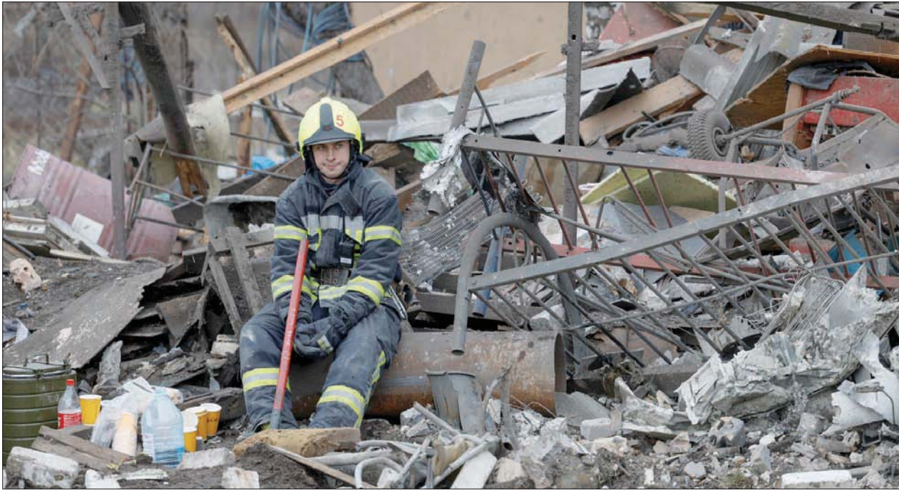
عامل إنقاذ يأخذ قسطاً من الراحة وسط دمار أحقة القصف الروسي بمنزل في كييف أمس

ووفقاً للمعطيات، فقد أطلق سلاح الجو الروسي أكثر من 120 صاروخاً في أنحاء البلاد، ودوت صفارات الإنذار في غالبية المدن الأوكرانية لخمس ساعات في واحدة من أطول فترات الإنذارات منذ انطلاق الحرب. وأعلن الجيش الأوكراني لاحقاً، أنه أسقط 54 صاروخاً من بين 69 أطلقها روسيا في هجوم بدأ في السابعة صباحاً بالتوقيت المحلي. وكتب الجنرال فاليري زالوجني، قائد القوات الأوكرانية على موقع «تلغرام»: «أطلق المعقدون صباح اليوم صواريخ كروز من الجو والبحر، وصواريخ موجهة مضادة للطائرات على منشآت البنية التحتية للطاقة في بلدنا». وجاء القصف بعد هجوم خلال الليل شنته طائرات مسيرة انتحارية إيرانية الصنع. وجاء الهجوم الواسع بعد رفض الكرملين خطة سلام أوكرانية، وتمسكه بأنه يتعين على كييف الإقرار بضم روسيا لأربع مناطق أوكرانية. وأعلن