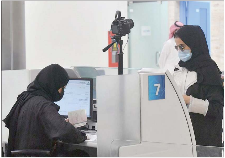
تعمل الحكومة السعودية على إجراءات تحفز على توظيف المواطنين (الشرق الأوسط)

وأعلنت وزارة الموارد البشرية والتنمية الاجتماعية في يناير (كانون الثاني) الحالي عن بدء سريان تطبيق قرار توظيف مهن خدمة العملاء، والمرحلة الثانية لـ«المهن القانونية»، في جمع أنحاء المملكة، وذلك بعد انتهاء فترة السماح المحددة لقرار توظيف هذه المهن. وجاء قرار الوزارة الأخير استمراراً لجهودها الهادفة إلى توفير بيئة عمل محفزة ومنتجة للمواطنين وزيادة مستوى مشاركتهم في سوق العمل وتعزيز مساهمتهم في المنظومة الاقتصادية وفقاً لـ«رؤية 2030». ووعدت الوزارة بتقديم حزمة من المحفزات والدعم تتعلق بمساندة منشآت القطاع الخاص لمساعدتها في توظيف المواطنين تشمل دعم عملية الاستقطاب والبحث عن العاملين المناسبين وكذلك عملية التدريب والتأهيل الضرورية، بالإضافة إلى أولوية الاستفادة من جميع برامج دعم التوظيف المتاحة لدى المنظومة.