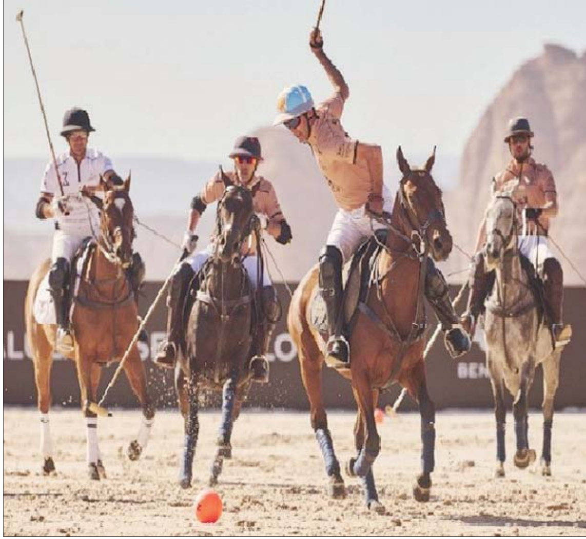
جانب من بطولة «ريتشارد ميل العلاء لبولو الصحراء» التي جرت الموسم الماضي

مرور الوقت ليكون شراكة طويلة الأمد بين الوجهتين العالميتين لرياضة البولو.