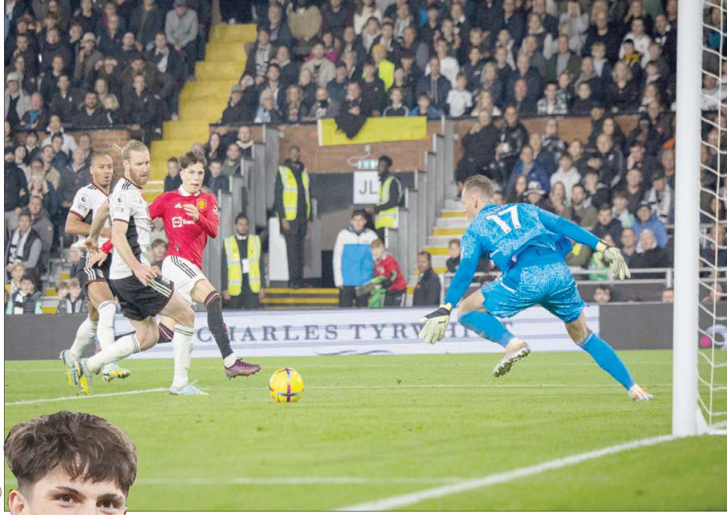
غارناتشو يحرز هدف الفوز القاتل لمانشستر يونايتد على فولهام في الدقيقة الثالثة من الوقت الضائع

وخلال الموسم الماضي، كان غارناتشو هو النجم الأبرز في فوز فريق مانشستر يونايتد للشباب بكأس الاتحاد الإنجليزي تحت قيادة ترافيس بينغتون، حيث سجل سبعة أهداف في المسابقة، بما في ذلك هدفان في المباراة النهائية ضد نوتنغهام فورست. وطوال المسابقة، كان هو اللاعب الذي يعتمد عليه اللاعبون الذين تقل أعمارهم عن 18 عاما لكي يصنع