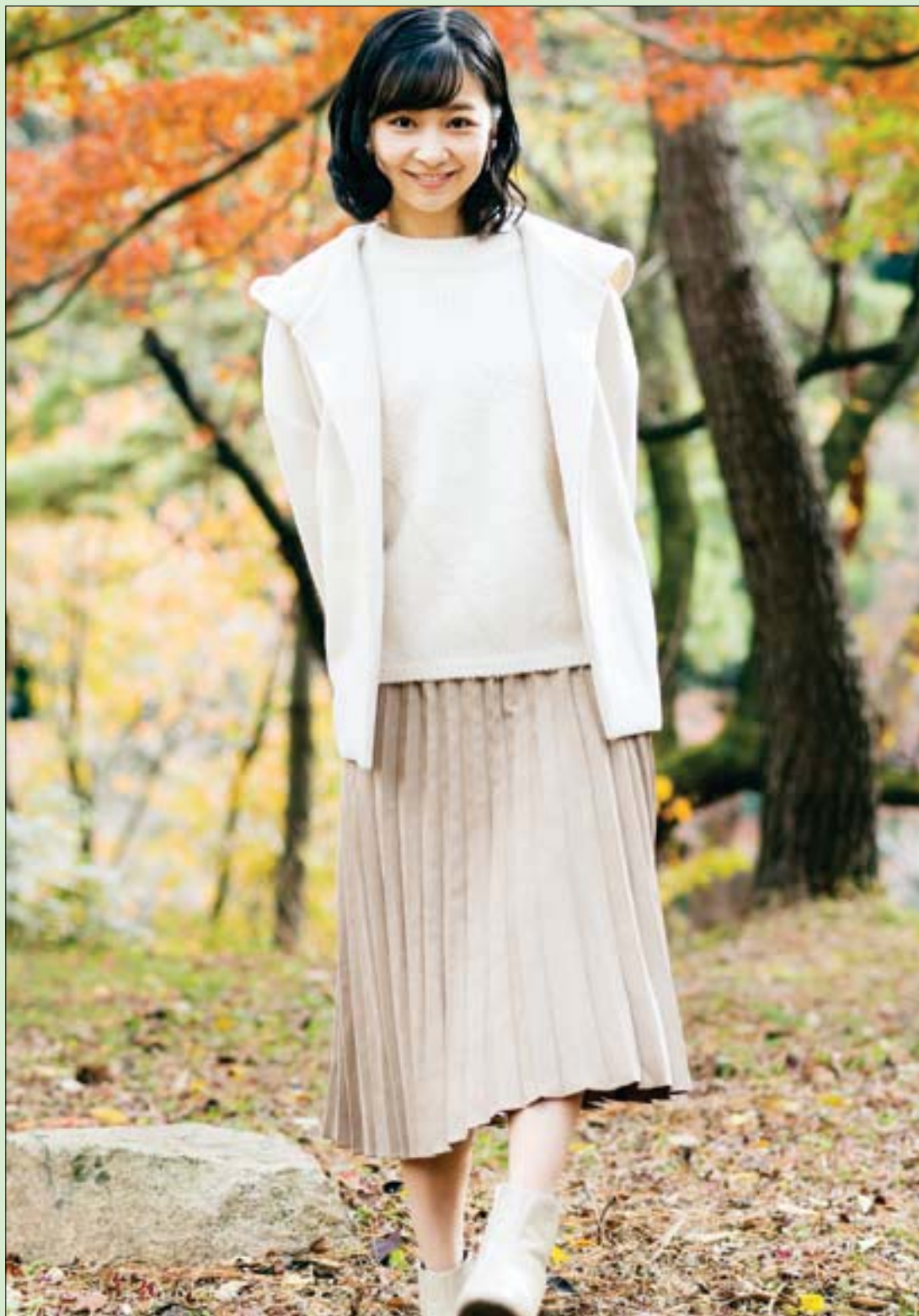
الأميرة كاكو محبوبة الشعب الياباني وابنة ولي العهد الأمير أكيشينو تحتفل اليوم الجمعة بعيد ميلادها 28 في طوكيو

هذا هو حصاد العام المنصرم، حرب أوكرانيا وثورة الشعب الإيراني استكمالاً فعلهما معنا هذا العام، أمّا توهج العرب في مونديال قطر، ففروجو الا يكون مجرد لمع شهاب عابر: