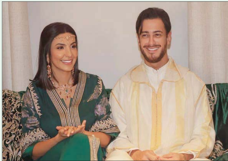
مع زوجته ريتا

شرم الشيخ (مصر) محمود الرفاعي قال الفنان المغربي سعد لمجرد إن ظروف الحياة كانت سبباً رئيسياً وراء غيابه الطويل عن الغناء في مصر التي عاد إليها مجدداً من أجل إحياء حفل غنائي كبير في مدينة شرم الشيخ، بجنوب سيناء. وتحدث لمجرد، في حوار خاص إلى «الشرق الأوسط»، عن رؤيته للأغنية المغربية، ومدى قدرتها على المنافسة عربياً وعالمياً، وتفاصيل أغنيته المصرية الجديدة «نفسى أشوفك» المقرر إطلاقها مع بداية عام 2023، كما علق على تصدر أغنيته المشتركة مع إليسا قوائم المشاهدة عبر موقع «يوتيوب» لعام 2022، واستعادته لدخول عالم التمثيل لأول مرة.