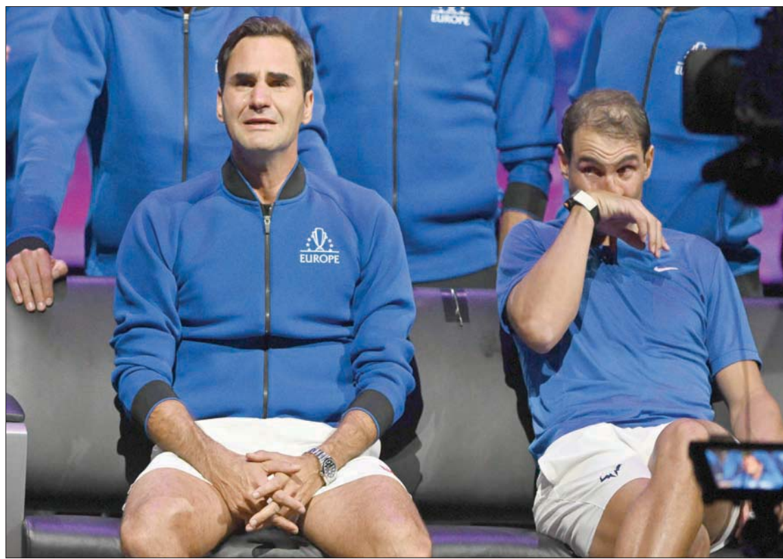
فيدير بيكي بعد آخر مباراة لعبها... ودموع نادال تشاركه الأجزاء

لكن الأهم من ذلك أن لاعبة البالغة من العمر 21 عاما وضعت نفسها في صدارة تصنيف لاعبات التنس في العالم. ومع ذلك، فمن المؤسف أننا لم نر بارتني وسواتيك في قمة مستواهما في