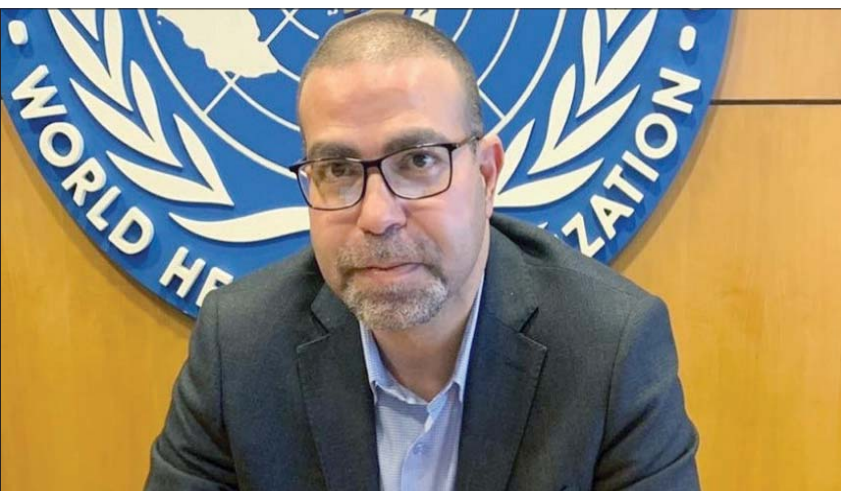
أمد الخولي رئيس اللوائح الصحية الدولية بمكتب إقليم شرق المتوسط بمنظمة الصحة العالمية (منظمة الصحة العالمية)

اختبارات جماعية وعمليات إغلاق لأي منشأة أو منطقة يظهر فيها حالات وحجر صحي طويل الأمد، لكنها الآن رفعت شعار «لا شيء»، حتى إنها ألغت اختبار