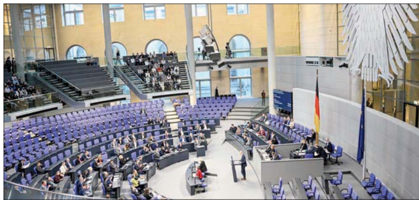
جلسة في البوندستاغ الألماني منتصف ديسمبر الحالي

وقال روتغن إن السياسة الأوروبية تتعارض مع السياسة الأميركية، مضيفاً: «في تناقض مع السياسة الأميركية، السياسة الخارجية لألمانيا وأوروبا فشلت في الاعتراف بأن ساعة الحقيقة قدق في إيران، يجب الاختيار الآن بين دعم الثورة أو دعم النظام. ولقار إضافة الحرس الثوري إلى قائمة العقوبات يكون قراراً ضد النظام». واتهم بيريوك بأنها لا تريد اتخاذ قرار مثل هذا، مضيفاً أن ألمانيا وأوروبا تقفان «على الجهة من التاريخ».