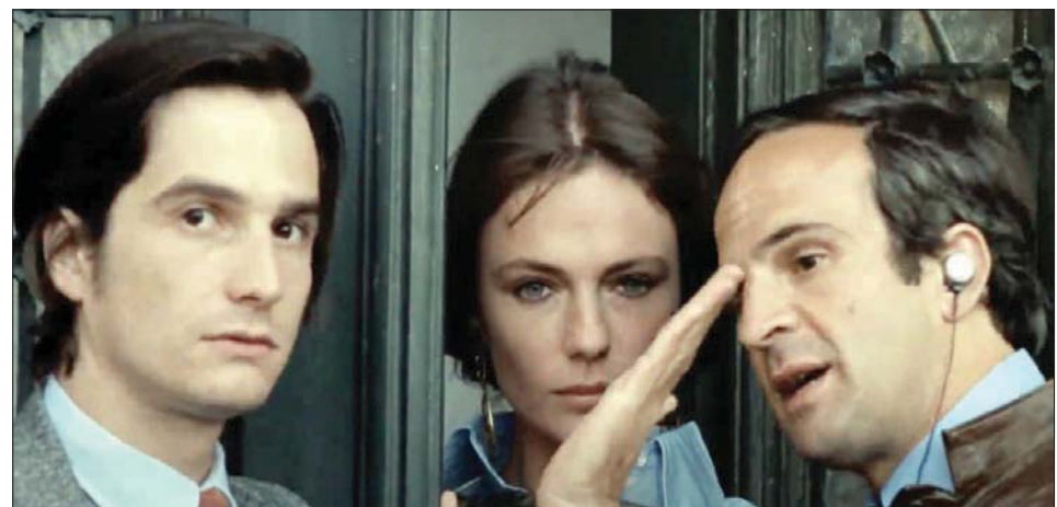
من اليمين: تروفو وبيتست وجان - بيير ليو

كل هذا وسواه هو أقرب لـ«سوب أوبرا» يصلح للشاشة الأميركية الصغيرة أو الكبيرة. وفرانسوا تروفو في الواقع خاطر هنا بالكثير من الحكايات الشخصية التي لا تستطيع