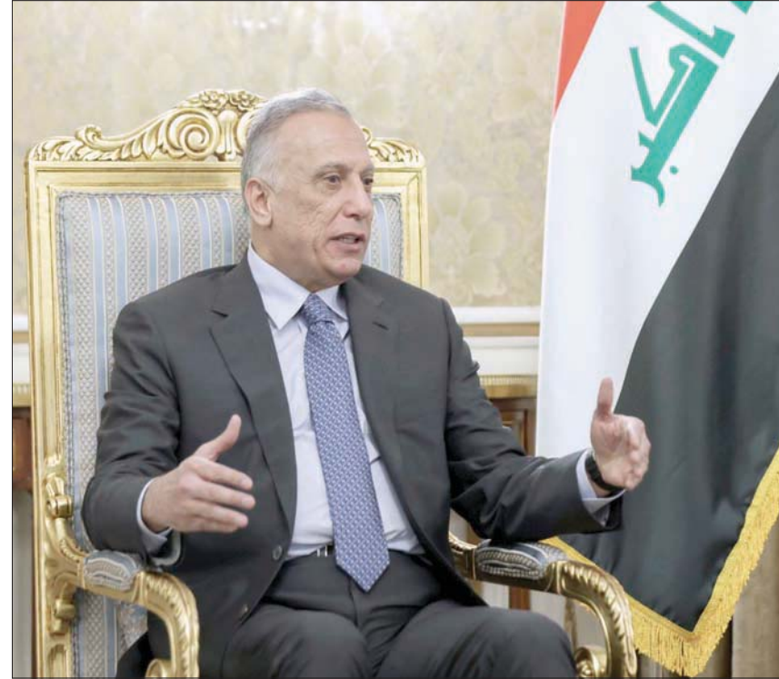
رئيس الوزراء العراقي السابق مصطفى الكاظمي

حدثت في عهده. وفيما دافع عن صمته في الاتهامات التي وجهت إلى «اللجنة أبو رغيف» فإنه رفض تحميل حكومته أسباب انحسار سعر صرف الدينار مقابل الدولار، بعد أن ربط البعض الأزمات بفصائح صدرت مرتبطة بمصارف؛ حدثت في عهده. وقال الكاظمي: «طبقاً للبيان، إن اللجنة مكافحة الفساد تشكلت لتلبية المطالب الشعبية، وجميع أوامر القبض التي نفذتها كانت باوامر قضائية».