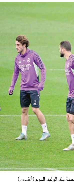
أنشيلوتي (يمين) وحصّة تدريبية استعداداً لمواجهة بلد الوليد اليوم

مديره، «الشرق الأوسط» اعترف الإيطالي كارلو أنشيلوتي، المدير الفني لفريق ريال مدريد الإسباني لكرة القدم، بالصعوبات التي سواجها فريقه خلال الفترة المقبلة، في ظل الأجندة المتخمة بالمباريات التي تنتظره. وقال أنشيلوتي: «الأجندة سوف تتطلب الكثير من الجهد منا. سيكون هناك الكثير من المباريات حتى مارس (آذار) المقبل». ويتطلع ريال مدريد للتتويج باللقاب رغم جدول مبارياته المزدحم خلال الفترة المتبقية من الموسم، حيث لا يزال يتنافس في كأس الملك والسوبر الإسباني ودوري أبطال أوروبا، وكأس العالم للأندية، بخلاف الدوري الإسباني.