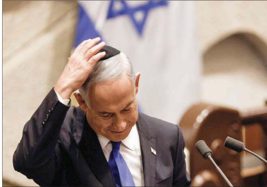
نتنياهو يلقى كلمته أمام الكنيست أمس

الحكومة الجديدة، ورفع بعضهم أعلام مجتمع مثليي الجنس، وأخرى كُتب عليها: «حكومة البلطجيين»، و«حكومة عصابة». وفيما يلي الحكومة كما عرضها نتنياهو: