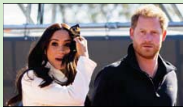
الأمير هاري وزوجته ميغان

بعد أن اعتذرت صحيفة «ذي صن» البريطانية عن مقال أثار سلباً من الانتقادات بسبب تضمنه إساءات موجّهة لدوقة ساكس، اعتبر الأمير هاري وزوجته ميغان هذا الاعتذار بأنه «حيلة دعائية»، حسب وكالة الصحافة الفرنسية.