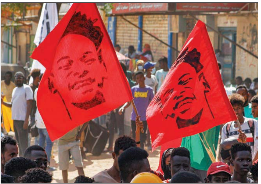
جانب من احتجاجات الخرطوم المطالبة بالحكم المدني في 19 ديسمبر (أ.ب)

إلتهاء حكم العسكر الحالي في البلاد، وعودة المؤسسة العسكرية للثكنات، مخلصاً هو متفق عليه في «الاتفاق الإطاري» مع قادة الجيش، تمهيداً لتشكيل سلطة انتقالية مدنية كاملة تعمل على تنفيذ مطالب «قوة ديسمبر 2018». ووجد حزب «المؤتمر السوداني» دعمه للاتفاق السياسي الإطاري، داعياً إلى «تكتيف التواصل مع قوى الثورة للاتفاق حول الاتفاق»، والمشاركة في الوصول إلى اتفاق نهائي، موجهاً المكتب السياسي بمضاغة الجهد، لإنجاز مهمة مناقشة القضايا الخمس التي تحتاج لتفصيل، عبر مشاركة سياسية ومدنية أوسع. وأهاب المجلس