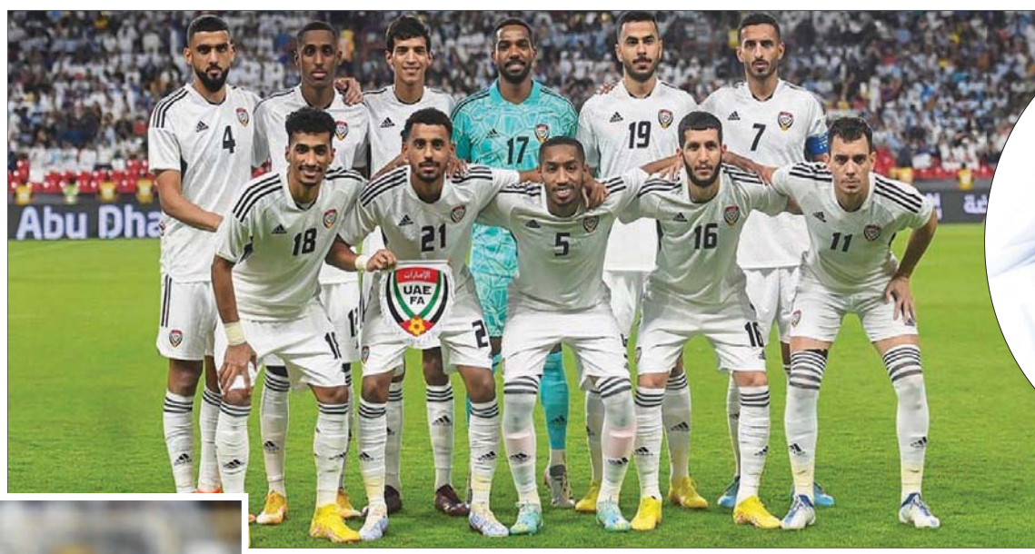
منتخب الإمارات فاز باللقب مرتين طوال مسيرته في كأس الخليج

بعضها بطولات قارية. ننظر من البطولة الخليجية القادمة برؤى المزيد من النجوم في سماء الكرة الخليجية من كافة المنتخبات المشاركة. بالحدوث عن المنتخب الإماراتي تحدياً فقد برز جيل ذهبي وصل لمونديال 1990 وأنت أحدهم، لكن لم يوفق المنتخب قبلها في تحقيق بطولة خليجية قبل تلك المشاركة الكبرى؟ - بطولة الخليج لها طابعها الخاص في المنافسة، ليس المنتخب الأفضل هو من يحزن بلل دوماً... هناك أمور تتعلق بهيمته، وحتى المنتخب السعودي الذي يشارك بالرديف لن يكون محطة للزود بالنقاط، وأتمنى بكل تأكيد أن يكون المنتخب الإماراتي بشكل أفضل ويحقق البطولة للمرة الثالثة. شخصياً «أتمنى أن تكون هناك محفزات أكبر» من أجل أن تشارك المنتخبات بكافة نجومها حتى لا تفقد البطولة قيمتها نسبياً من الناحية الفنية ومن حيث الاهتمام. ● هل تعتقد أن حضور الجماهير سيكون فاعلاً لجميع المنتخبات؟ - في بطولات الخليج الماضية كانت للجماهير بصمة كبيرة وأتمنى أن يستمر ذلك، نحن سعداء جميعاً أن تنافس البطولة في البصرة وفي دولة العراق الشقيقة، «أهل العراق أهلنا وسكرمون كعادتهم أبناء الخليج وكل من يزورهم من أبناء الخليج...» وأتمنى أن تحقق البطولة كافة الأهداف، وأن تشهد منافسة قوية بين المنتخبات المشاركة.