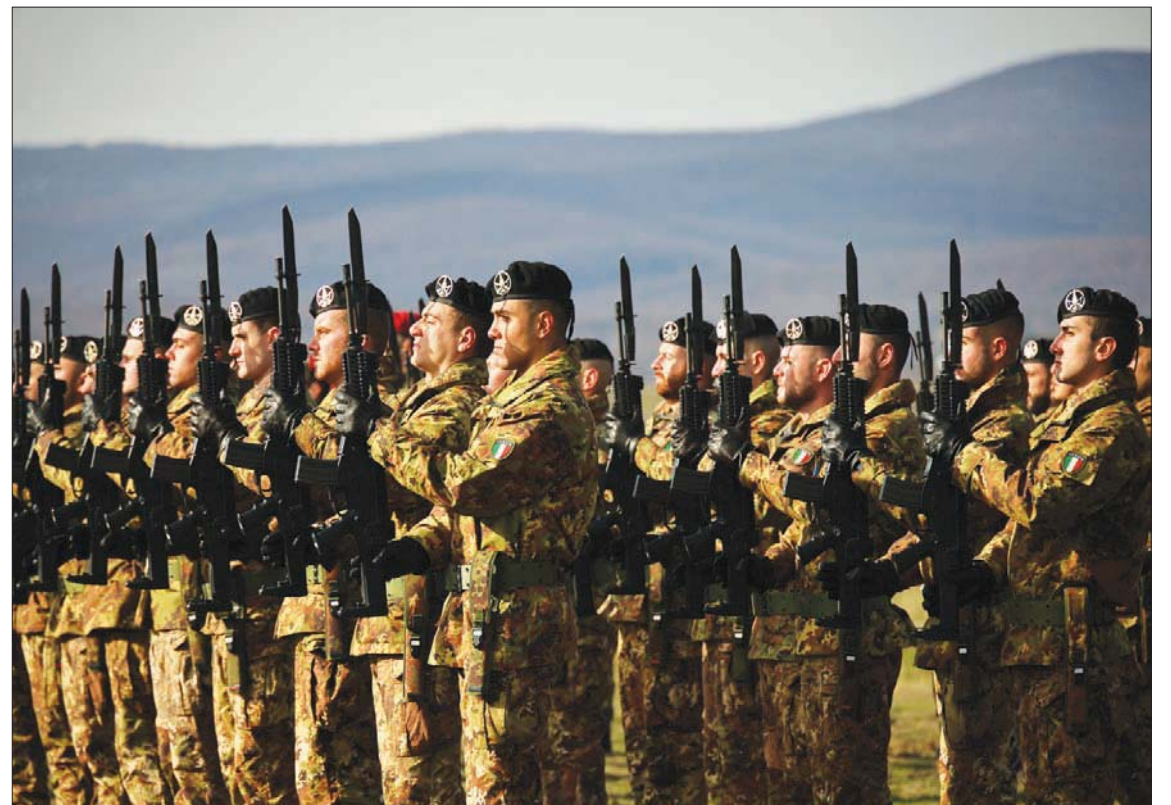
جنود إيطاليون من عداد «الناتو» في بلغاريا قبل نحو أسبوعين