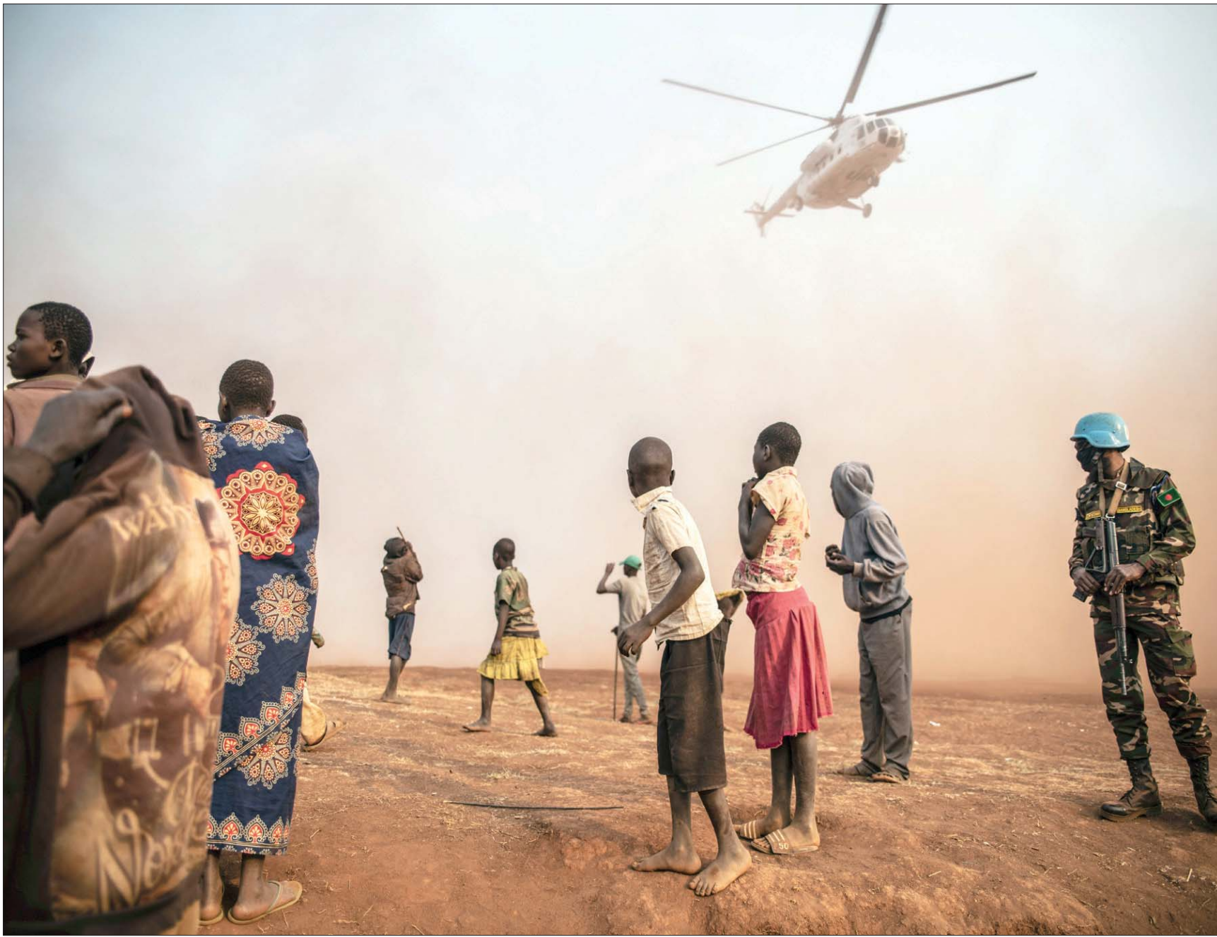
أفريقيا تعد من ضحايا الحرب الروسية - الأوكرانية

اليوم، نرى ما قام به المغامر الروسي في القرن التاسع عشر في منطقة تاجوراء بجيبوتي، يتكرر في مناطق عدة بالقارة الأفريقية، تحت اسم جديد، وهو قوات «فاغنر» المسلحة الروسية، من دون أن تعترف موسكو بتبعيةها الرسمية لها.