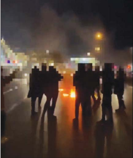
محتجون يضرمون النار في طريق عام وسط مشهد

وفي جامعة شريف الصناعية بطهران، شارك عشرات الطلبة في اعتصام؛ احتجاجاً على اعتقال أحد الأساتذة في قسم الكمبيوتر على يد جهاز الاستخبارات الإيرانية. وانتشرت أغنية من طلاب كلية الموسيقى في جامعة طهران، بمناسبة مرور 100 يوم على الاحتجاجات، يرددون فيها كلمات أغنية ثورية للمغني الشاعر المعارض فريدون فرخزاد، الشقيق الأصغر للشاعر فرغ فرخزاد، الذي عُثر على جثته في سقته بمدينة بون الإيرانية في أغسطس 1992. وتفجرت الاحتجاجات بعد وفاة مهسا أميني (22 عاماً)،