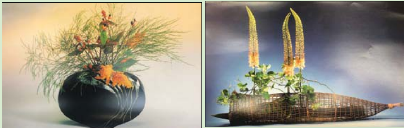
بعض نماذج فن «إيكيبانا» الياباني (الشرق الأوسط)