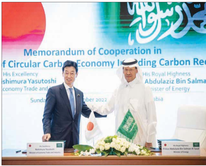
وزير الطاقة السعودي مع وزير التجارة الياباني خلال توقيع مذكرتي تعاون أمس

الرياض، «الشرق الأوسط» أبرمت وزارة الطاقة السعودية، أمس (الأحد)، مذكرتي تعاون مع اليابان في مجالات الاقتصاد الدائري للكربون والهيدروجين النظيف ووقود الأمونيا ومشتقاتها. ووقع الأمير عبد العزيز بن سلمان وزير الطاقة السعودي، ونيشيمورا ياسوتوشي وزير الاقتصاد والتجارة والصناعة الياباني، مذكرتي التعاون، بحسب ما ذكرته الوزارة السعودية. وعقد الأمير عبد العزيز بن سلمان، ونيشيمورا ياسوتوشي، أمس، الاجتماع الوزاري الأول لـ«الحوار الوزاري السعودي الياباني للطاقة» في مدينة الرياض. من جانب آخر، تنظم وزارة الاستثمار، اليوم (الاثنين)، منتدى الاستثمار السعودي- الياباني في