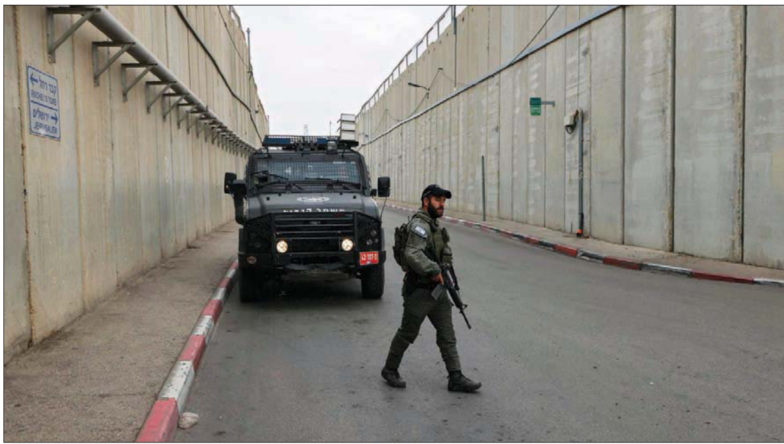
الحاجز الفاصل في الضفة الغربية أمس

غفير، لزيادة الضغط على المجتمع العربي. كما كشف عن قوانين تعطي امتيازات أخرى لدعم التعليم في