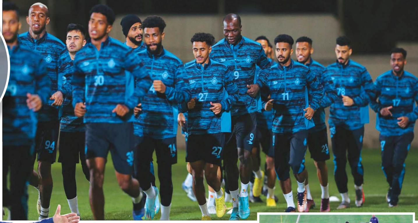
لاعبو النصر هل ينجحون في تجاوز الغريم التقليدي

وفي مدينة حفر الباطن، يبحث صاحب الأرض عن تحقيق فوزه الأول على صعيد الدوري، وذلك عندما يلاقي الرائد، حيث نجح الباطن بتحقيق الفوز في بطولة كأس الملك، وهو الأمر الذي يسعى لإعادته دورياً، أما الرائد الذي يعيش أياماً صعبة بعد خسارته برياعة أمام النصر، وتوديعه بطولة كأس الملك سريعاً، فبالتأكيد سيحاول جاهداً الخروج بنقاط المباراة، خصوصاً وأن الفريق تنتظره مواجهة تنافسية مثيرة أمام التعاون.