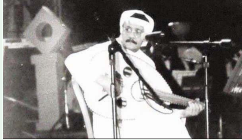
طلال مداح على مسرح «المفتاح»

مؤكداً أن إهداء العديد من الفنانين رغبتهم في المشاركة بتكريم طلال مداح، يعكس مدى تأثيره عليهم خلال سنوات تواجده في الساحة الفنية. ويضيف زريقان أن طلال مداح ساهم في ولادة عدد كبير من الفنانين والممثلين الذين يدنون بالفصل له في انطلاق مسيرتهم، ومنهم المحنثون سامي إحسان وسراج عمر ومحمد شفيق، والفنان عبادي الجوهري وعلي عبد الكريم وعبد المجيد عبد الله، وغيرها من الأسماء الكبيرة التي ما زالت موجودة في الساحة الفنية. مؤكداً أن إهداء العديد من الفنانين رغبتهم في المشاركة بتكريم طلال مداح، يعكس مدى تأثيره عليهم خلال سنوات تواجده في الساحة الفنية. ويضيف زريقان أن طلال مداح ساهم في ولادة عدد كبير من الفنانين والممثلين الذين يدنون بالفصل له في انطلاق مسيرتهم، ومنهم المحنثون سامي إحسان وسراج عمر ومحمد شفيق، والفنان عبادي الجوهري وعلي عبد الكريم وعبد المجيد عبد الله، وغيرها من الأسماء الكبيرة التي ما زالت موجودة في الساحة الفنية.