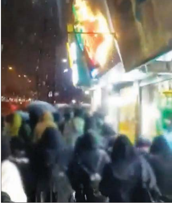
محتجون بمدينة كرج غرط طهران (تويت)

رجال الدين، لوماً إلى المقربين من النظام، بسبب صمتهم خلال الاحتجاجات. وقال تقوي إن «ضربة صمت الخواص ليست أقل من مثيري الشغب». وقال، في وصف هؤلاء: «من وصلوا إلى مناصب كبيرة ويقومون بسادور اجتماعية ويؤثرون على مجموعات». وأشار تحديداً إلى «الفنانين ومراسلي الغاليات، والشعراء والعلماء وأساتذة الجامعات، والمشاهير والأبطال الرياضيين، والفنانين والوزراء والمحامين، والمسؤولين». وقال إنها «القوات التي جلست على مناداة النظام وتقدمت، موجها اتهامات إلى «الأعداء» بالسعي وراء التحريش على «العصيان المدني»، و«تشويه الشخصيات»، و«تقليل مكانة النظام». وكانت «جمعية مدرسي