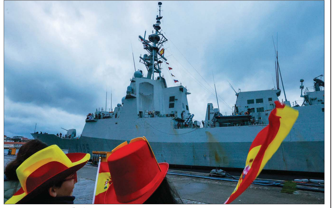
إسبانيون يرحبون بفرقاطة بعد عودتها من مهمة لـ«الناتو» في 19 ديسمبر