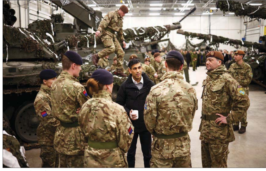
رئيس الوزراء البريطاني ريشي سوناك يتحدث مع جنود من «الناتو» في إستونيا 19 ديسمبر الجاري (رويترز)