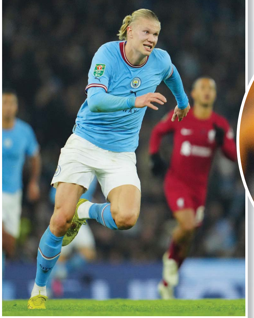
هالاند قوة مانشستر سيتي الضاربة هجوماً وسلاحاً في محاولة الاحتفاظ باللقب

ويستحق الأوسم، وبمجرد ما يغيب عن نصف الملعب في اليوم (الآنين)، ويأتي تعاقد وولفرهامبتون مع المدير الفني الإسباني ضمن خطة لإعادة هيكلة النادي تضمنت أيضاً التعاقد مع مدير رياضي جديد، كما يسعى النادي للتعاقب مع عدد من اللاعبين المميزين خلال فترة الانتقالات الشتوية المقبلة، التي ستوصل إلى اتفاق بالفعل على ضم النجم البرازيلي ماتويوس كونها. ويأمل ساوثهامبتون الذي أقامه هانز هانزوتل، وعين بدلاً منه ناثان جونز قبل التوقف بأيام، في أن يحقق نتائج أفضل تحت قيادة مدرسه الجديد. وحقق ساوثهامبتون فوزاً واحداً فقط في مبارياته العشر الأخيرة في الدوري،