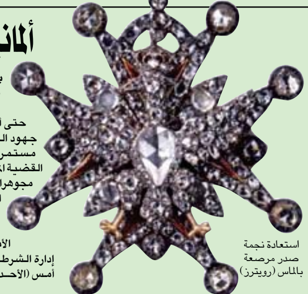
استعادة نجمة صدر مرصعة بالماس

من الشرطة من عدة ولايات ألمانية يجنون منذ ساعات الصباح على عمق يقارب 150 متراً عن أدلة في قاعة لاندفير. وأضافت الإدارة: «في الوقت نفسه، يقوم أفراد الشرطة بتأمين المنطقة المجاورة، وسوف تستغرق هذه الإجراءات بعض الوقت»، لكنها لم تذكر مزيداً من التفاصيل، وقالت إنه من غير الممكن في الوقت الراهن الإلقاء مزيد من المعلومات، نظراً للتحقيقات الراهنة، «وهذا يشمل أيضاً نتائج عمليات البحث».