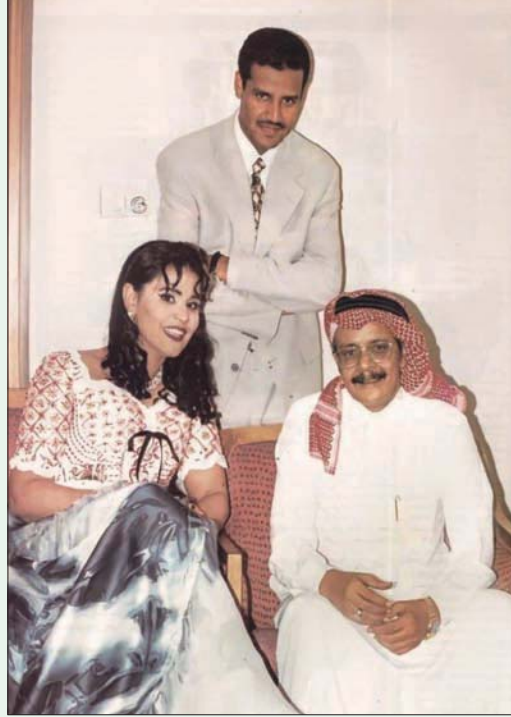
طلال مداح برفقة أحلام وخالد عبد الرحمن