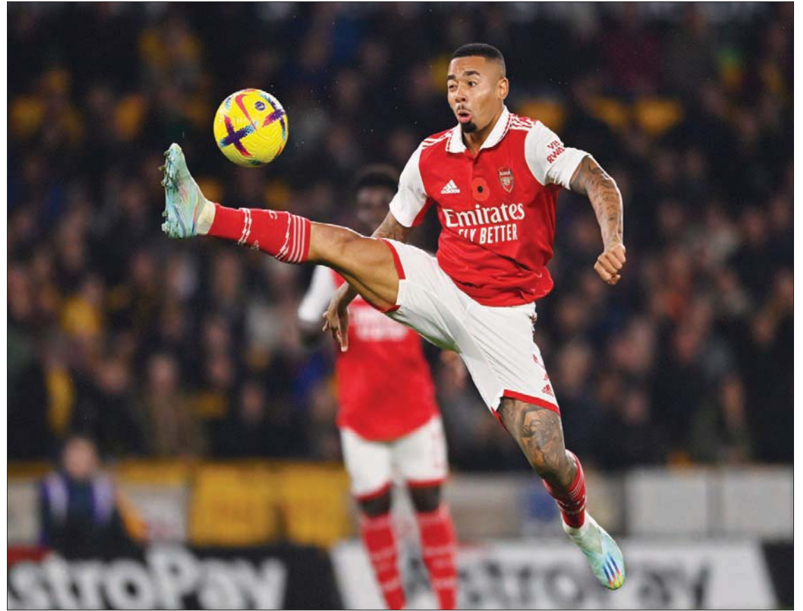
إصابة خيسوس تهدد حظوظ أرسنال في الاستمرار على القمة