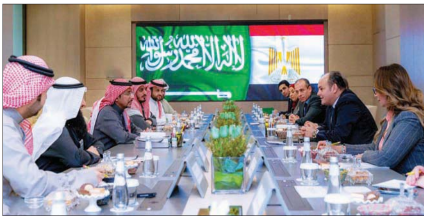
جانب من اجتماعات الوفد المصري برئاسة وزير التجارة والصناعة مع الجانب السعودي في الرياض

في مصر، والهيئة السعودية للمدن الصناعية ومناطق التقنية. ولفت الوزير إلى أن لقاءه ماجد القصبي، وزير التجارة السعودي، أكد أهمية تعزيز الجهود المشتركة لتيسير حركة التجارة البينية بين مصر والمملكة. ومن ثم الإرتقاء بمعدلات التبادل التجاري بين البلدين التي بلغت العام الماضي نحو 4 مليارات و572 مليون دولار، مقارنة بنحو 3 مليارات و236 مليون دولار عام 2020، محققة نسبة زيادة بلغت 41,3 في المائة، مشيراً إلى أن السعودية تحتل المرتبة الثانية في قائمة الدول المستثمرة في السوق المصرية باستثمارات تبلغ 6,12 مليار دولار في عدد 6017 مشروعاً في مجالات الصناعة والأنشطة والسياحة والزراعة والخدمات