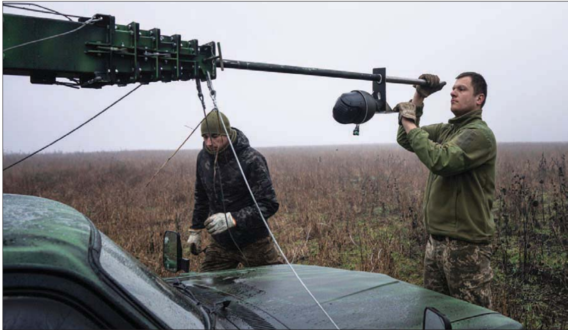
جنود أوكرانيون يركبون كاميرا فوق برج تلسكوبي مثبت على سيارة قرب جبهة القتال في خاركيف أمس

موسكو - كييف، «الشرق الأوسط»، قال الرئيس الروسي فلاديمير بوتين، في مقابلة بثت أمس الأحد، إن بلاده مستعدة للتفاوض مع كل أطراف الصراع الأوكراني، وشدد أيضاً على أن الجيش الروسي «سيدمر» نظام الدفاع الجوي «باتريوت» الذي استزود به الولايات المتحدة وأوكرانيا. وتسبب الغزو الروسي لأوكرانيا في 24 فبراير (شباط) الماضي في أشد الصراعات دموية في أوروبا منذ الحرب العالمية الثانية، وكرر مواجهة بين موسكو والغرب منذ أزمة الصواريخ الكوبية، في عام 1962. ولا تلوح في الأفق حتى الآن أي بادرة أمل على نهاية الحرب. ويقول الكرملين إنه سيفاقل حتى تتحقق جميع أهدافه، بينما تقول كييف إنه لن يهدأ لها بل حتى ينسحب آخر جندي روسي من أراضيها، بما في ذلك شبه جزيرة القرم التي ضمتها روسيا عام 2014.