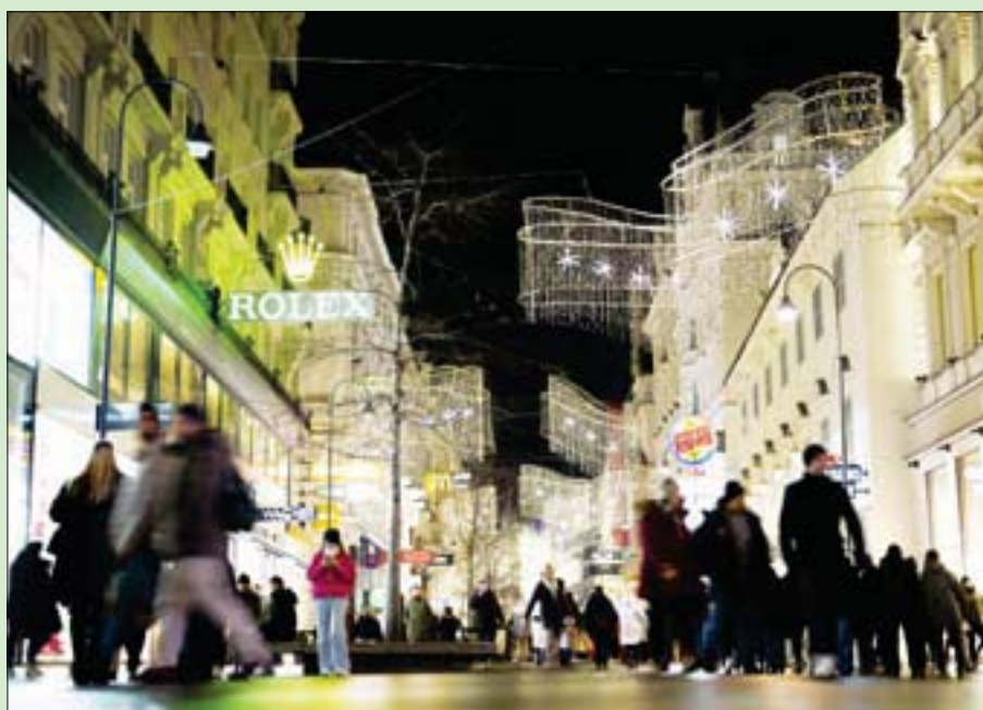
شارع كارتز الأشهر وسط فيينا خلال عيد الميلاد

السنة الشهيرة، ويمكن للمسنيين وهم على كراسيهم المتحركة ويرفقة أحد أقرانهم أو مقدم رعاية من دور لكبار السن، أن يستعدوا ومتعة حضور الحفلات الموسيقية من دون شعورهم بأي ضغوط. وعلى المسرح، يقدم ثلاثة موسيقيين بولنديين شباب عرضاً يضم مقطوعات لفرانز شوبرت أو يوهانس براهمس، مع رواية تفاصيل عن حياة المؤلفين الموسيقيين وتاريخية ترائيم عيد الميلاد، وتسود المكان أجواء حميمة وملئمة بالأحاسيس تدفع المسنيين إلى الالتقاء على أكتاف من بجانبهم. وتقول ماندا المتخصصة في التدريس الموسيقي «أقوم بأبحاث كثيرة» لمعرفة «تفاصيل تعود إلى مرحلة شباب الأشخاص الذين يحضرون الحفلة»، وتحدد برنامج يلائم ماضيهم.