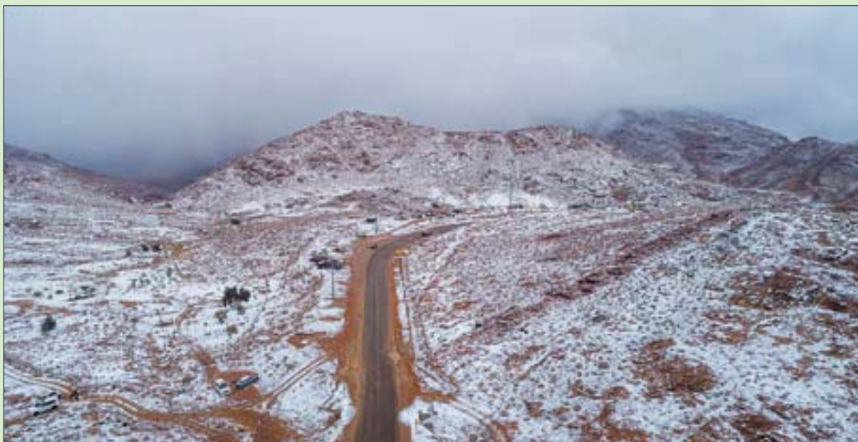
يعد جبل اللوز أحد أعلى القمم الجبلية في السعودية ويبلغ ارتفاعه قرابة 2500 متر