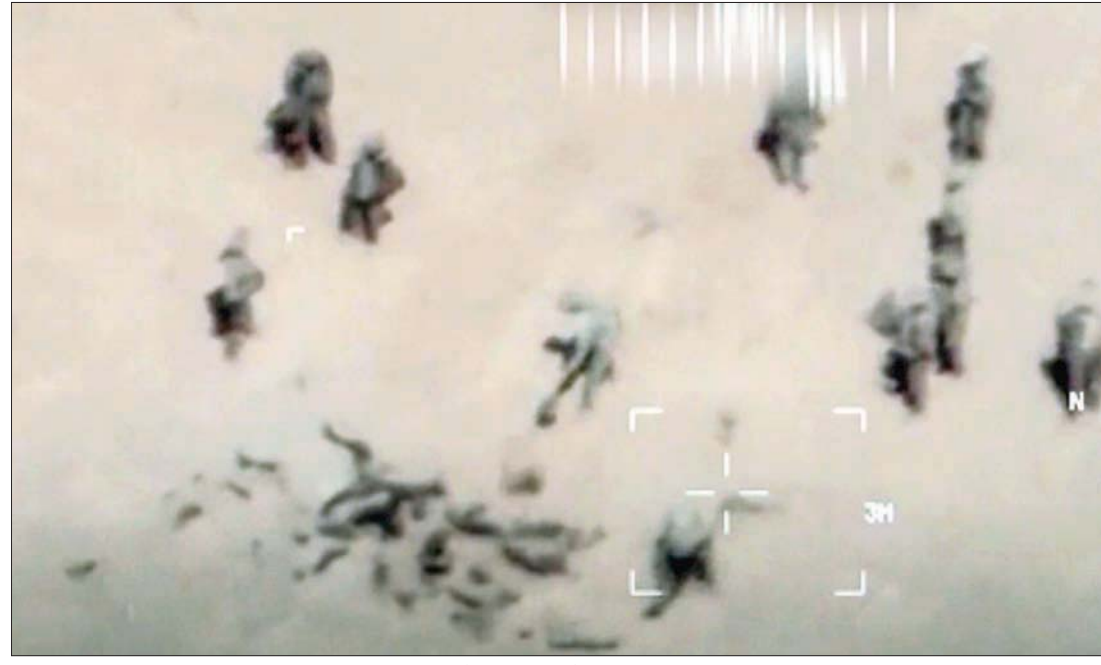
صورة غير مؤرخة مأخوذة من مقطع فيديو تظهر جنوداً يدفنون جثثاً في شمال مالي، في حين قال الجيش الفرنسي إن لديه مقاطع فيديو لمرتزقة روس وهم يدفنون جثثهم في الموقع نفسه (أ.ب.)