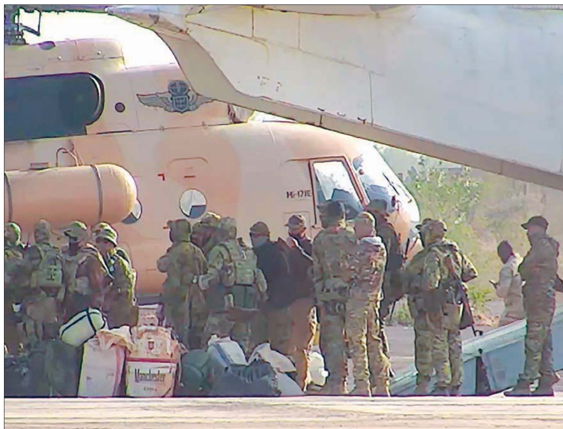
تظهر هذه الصورة غير المؤرخة التي وزعها الجيش الفرنسي مرتزقة روساً يستقلون مروحية في شمال مالي

«الهجوم أفضل وسيلة للدفاع»، كانت المقولة التاريخية العسكرية التي أطلقها نابليون بونابارت،