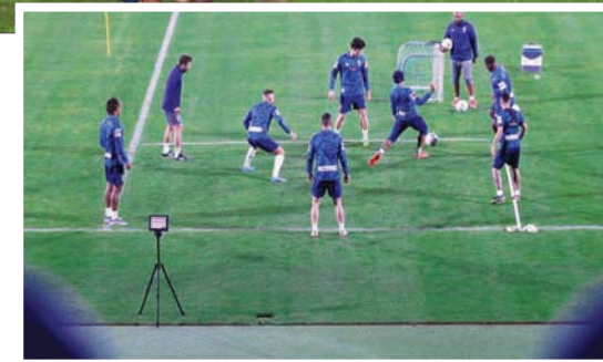
الهلال أكثر توفيقاً على النصر في المواجهات المباشرة

الموسم الثلاثة الأخيرة. أما الهلال الذي أعاد شيئاً من الثقة لانتصاره ومحبيه بعد فوزه العريض برياعة أمام الاتفاق في دور الستة عشر ببطولة كأس الملك، بعدما قدم مباريات مرعبة فوزه الصعب على الباطن وخسارته أمام نيوكاسل في بطولة كأس موسم الدرعية وخسارته ودية الشعلة. وانتعش الهلال بجاهزية سعود عبد الحميد وناصر الدوسري والكوري الجنوبي جيانغ هيون، خصوصاً الأخير الذي سيعزز من قوة دفاع الهلال الذي يغيب عنه على الليهي حتى الآن لإصابات مختلفة. ويقدف الهلال لخدمات ياسر الشهراني وسلمان الفرج وموسى ماريغا وعلي البلهني، إلا أن الأزرق يملك العديد من الأسماء القادرة على تعويض غياب لاعبيه، وتأكيد أفضائه بالمنافسة على لقب البطولة التي افتقدتها في