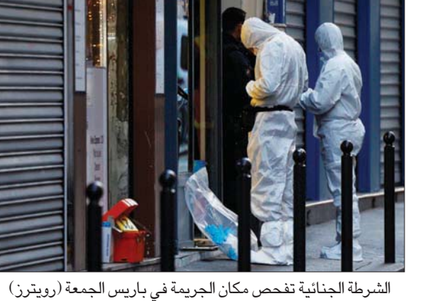
الشرطة الجنائية تفحص مكان الجريمة في باريس الجمعة