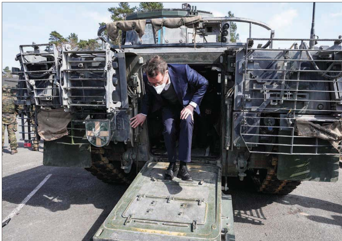
رئيس وزراء ولاية شمال الراين-ويستفاليا هنريك ويست خلال زيارته لقاعدة المشير روميل باراكس في أوغستدورف بألمانيا في 30 مارس 2022.

وكان رد «ناتو» شديد اللهجة، إلى جانب بعض العقوبات وتعليق التعاون (حتى ذلك الحين، ظلت قنوات الاتصال السياسية والعسكرية مفتوحة). لكن روسيا لم تتأثر، بل تشجعت أكثر برد الفعل الواهن من هذه المرة، وعندما قامت روسيا بغزو أوكرانيا، وقف «ناتو» إلى جانب أوكرانيا بحماس ظاهر. وفي مارس (آذار) 2022، عقد رؤساء دول وحكومات دول «ناتو» قمة استثنائية في بروكسل،