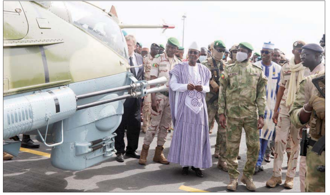
الرئيس المالي المؤقت أسني غوتا ومسؤولون خلال حفل تسلم شحنة روسية جديدة للقوات المسلحة المالية في باماكو 09 أغسطس 2022