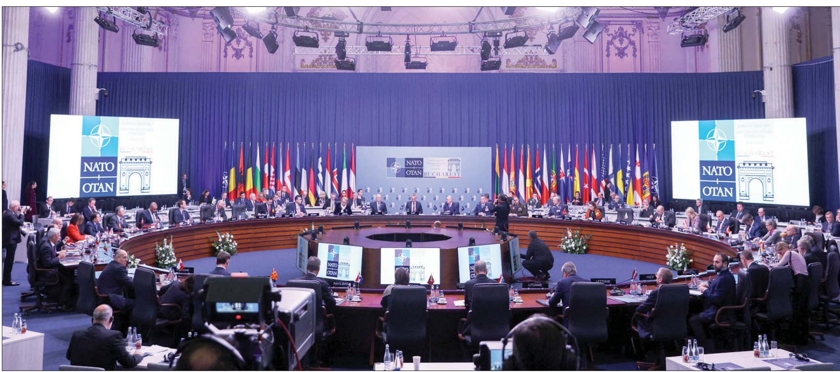
اجتماع وزراء خارجية «الناتو» في العاصمة الرومانية بخارست 30 نوفمبر 2022

وفي مواجهة الحرب في أوكرانيا والبيخة الجيوسياسية الجديدة، يبدو أن «ناتو» يتخذ موقفاً محدداً في مواجهة التهديد المشترك لهذا الجيل الجديد من الحرب الباردة. لكن هناك أسبانياً للقلق من أن الحرب قد يكون لها رد فعل عكسي، لأنها مكلفة من نواح كثيرة حتى لأعضاء «ناتو».