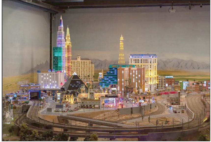
نموذج مصغر عن لاس فيغاس

وفي الطابق الرابع، مررنا بالمقياس المركزية لجميع العروض الموجودة في المكان، التي كانت مليئة بالشاشات الكبيرة والإلكترونيات، فقد بدأ المكان وكأنه مثل المطبخ المفتوح، ففي هذه المنطقة من المعرض لم تكن هناك الأنظمة التي تتحكم في القطارات والمركبات والإضاءة فحسب، ولكن كانت كاميرات الفيديو تتتح للموظفين مراقبة أشياء، مثل انحرافات القطارات ومواطن الخطل الأخرى التي يمكن أن تحدث مع العديد من الأجزاء المتحركة في المعرض. واكتشفنا أن الأجواء لا تبدو مشمسة دائماً في الواقع المصغرة، كما هو الحال في الواقع أيضاً، حيث كانت تتحول الإضاءة داخل المعارضات من النهار إلى الليل بدقة، إذ تُصنَع الغرف المصغرة مظلمة، حيث كان يُشغّل ما يقرب من نصف مليون مصباح «اليد» داخل الديوراما الإيطالية، وترجمت كل هذه الأضواء لتشكل بشكل تدريجي بدلاً من تشغيلها مرة واحدة، مما يؤدي إلى إنشاء محاكاة لشكل غروب الشمس.