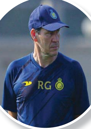
المدير الفني الفرنسي الآمال مقلعة عليه لكسب الديربي

حتى الآن، إلا أن تعادلاته ساهمت بابتعاده عن المتصدر بفارق أربع نقاط. ويحثل الاتحاد قبل بدء منافسات هذه الجولة المركز الخامس برصيد 18 نقطة، إلا أن جاهزية عدد من الأسماء التي كانت غائبة في الفترة السابقة ستساهم في توفير الكثير من الحلول الفنية للمدرب. من جانبه، يبدو فريق التعاون يبحث عن تعويض خروجه المرير من بطولة كأس الملك بتحقيق نتيجة إيجابية، خصوصاً أن الفريق يسبق الاتحاد بلائحة الترتيب، ويملك عشرين نقطة بفارق نقطتين عن المتصدر، وفي مدينة حفر الباطن، يبحث صاحب الأرض عن تحقيق فوزه الأول على صعيد الدوري، وذلك عندما يلاقي الرائد، حيث نجح الباطن بتحقيق الفوز في بطولة كأس الملك، وهو الأمر الذي يسعى لإعادته دورياً، أما الرائد الذي يعيش أياماً صعبة بعد خسارته برياعة أمام النصر، وتوديعه بطولة كأس الملك سريعاً، فبالتأكيد سيحاول جاهداً الخروج بنقاط المباراة، خصوصاً وأن الفريق تنتظره مواجهة تنافسية مثيرة أمام التعاون.