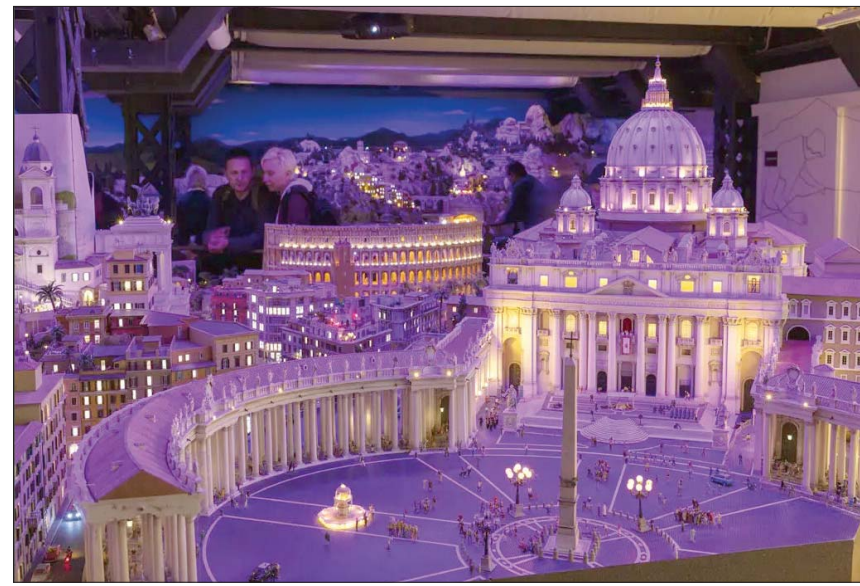
نموذج لساحة القديس بطرس في الفاتيكان