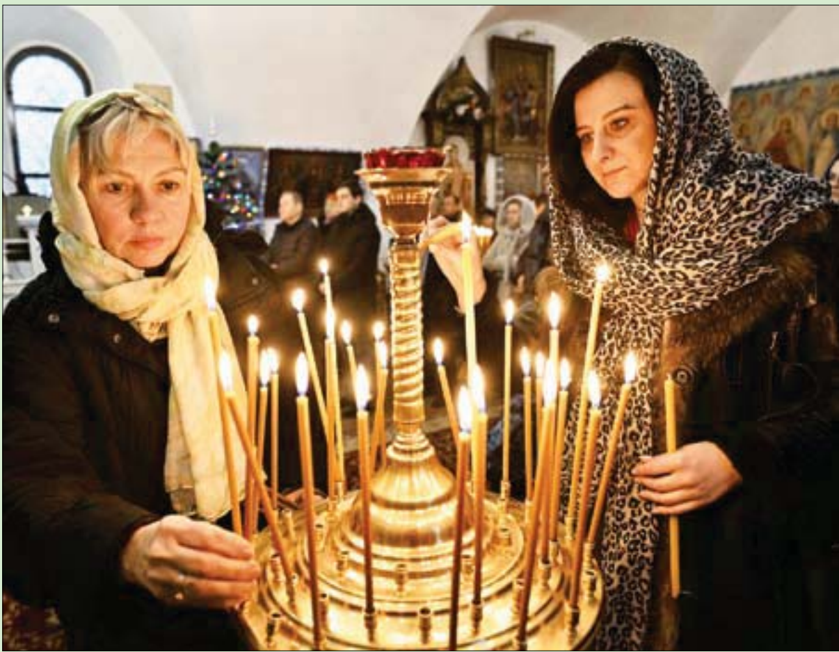
موسكو - كييف: «الشرق الأوسط»

أكد الرئيس الروسي فلاديمير بوتين، استعداد بلاده للتفاوض مع كل أطراف الصراع الأوكراني، وتعهد تدمير أنظمة الدفاع الجوي «باتريوت» التي تخطط واشنطن لتسليمها إلى كييف، واتهم من جهة أخرى الغرب بمحاولة تقسيم روسيا.