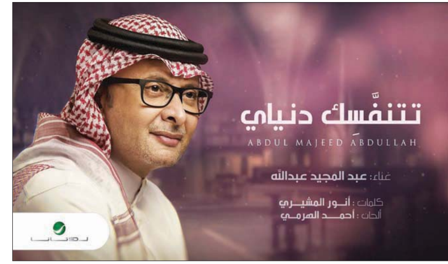
عبد المجيد عبد الله

فيما تصدر الفنان عبد المجيد عبد الله قائمة الأغنيات السعودية الأكثر استماعاً في العام المشرف على الانتهاء، بعد أن حلت أغنيته «غزل ما بنصادي» في المركز الثاني والعشرين بعد أن حققت 75 مليون مشاهدة، متفوقاً على أغنيته الثانية «تتنفسك دنياي» التي حققت 64 مليون مشاهدة، ومتفوقاً بـ 12 مليون مشاهدة على أغنية مواطنه راشد الماجد «مليون مرة»، والتي قدمها مع الفنان اليمني فؤاد عبد الواحد. وشهدت القوائم ظهور مطربين جدد طرحوا أعمالاً لأول مرة، من بينهم المطرب المصري الشاب علي لوكا بأغنية «متخافيش ياما»، وفريد بأغنية «بإمارة مين»، والديوتو الفني الكويتي روان ودافني بأغنية «أديسوس»، في حين اختتمت المهرجانات الغنائية من قائمة أكثر 25 أغنية مشاهدة في عام 2022. وجاء أول مهرجان غنائي في المركز السابع والأربعين بأغنية «مالك يا صحبي أحييلي» وحققت 49 مليون مشاهدة.