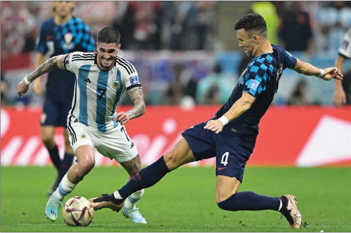
نصف النهائي المونديالي شهد تفوقاً أرجنتينياً طيلة أوقات المباراة