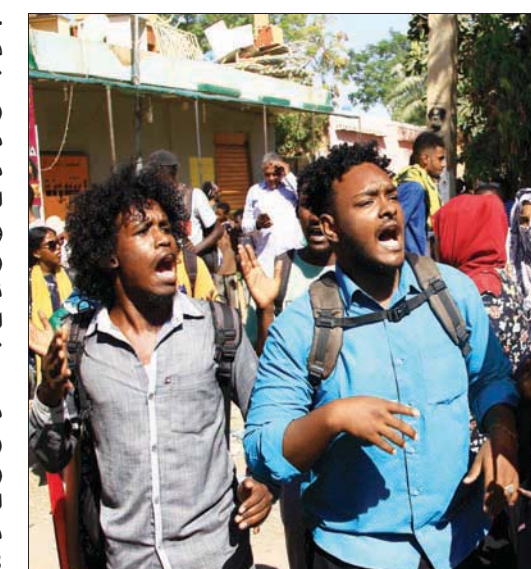
جانب من الاحتجاجات المطالبة بالحكم المدني في الخرطوم أمس (أ.ب.)

حل نهائي لتحقيق أهداف ثورة ديسمبر». ودعت لوضع خطة لإدارة الحكومة الانتقالية بمهام واضحة ومباشرة، لا تتضمن مشاركة العسكر ب«مختلف مسميات وحداتهم، والأحزاب السياسية والنظام البائد»، وتابعت: «التصعيد السلمي والعمل والمؤثرات المخصصة تعبير سيستمر حتى سقوط كل المتسلقين وأصحاب الأغراض التي لا تخدم المصلحة العامة». وخرجت المظاهرات في كل من الخرطوم وبحري وأم درمان، وعدد من المدن السودانية الأخرى، وفي مدينة الدمازين حيث انطلق أول الاحتجاجات المطالبة برحيل البشير في 13 ديسمبر 2018، ومنها انتشرت في مدن البلاد الأخرى، نددت بالعمل السياسي وبالحكم العسكري. وعلمت «الشرق الأوسط» أن المجلس المركزي لتحالف «الحرية والتغيير» الذي يمثل الطرف الرئيسي في الاتفاقية الإطارية الموقعة مع الجيش، سيعقد اجتماعاً معها، للبت في طلبات الراغبين في توقيع الاتفاق الإطاري، ويبعث أجال ورش العمل والنشاطات السياسية من المناقشة القضايا المؤجلة من الاتفاق الإطاري مع أصحاب المصلحة.