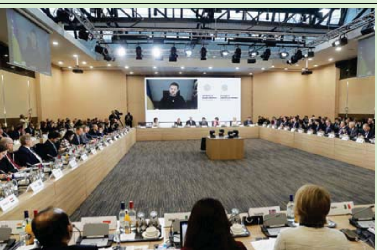
زيليغسكي يتحدث عبر تقنية الفيديو في مؤتمر باريس أمس