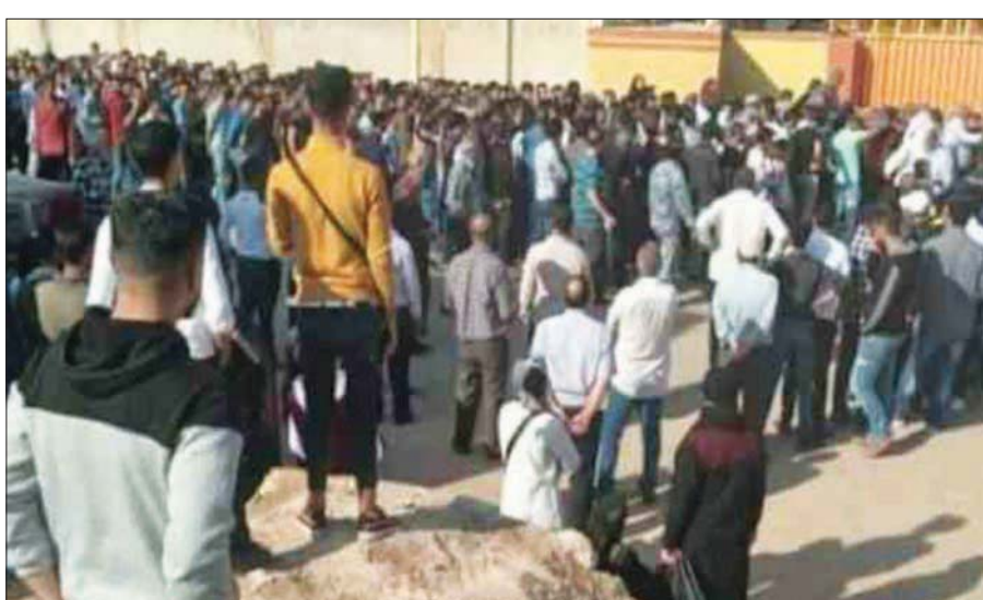
أعداد كبيرة من الشباب في درعا أمام إدارة الهجرة والجوازات لاستصدار جواز السفر

يتطلع إليه. فخدمة البعض امتدت لتتجاوز 10 سنوات وهي الخدمة الإلزامية مع إضافة الاحتياطية. ومن هذا المنطلق، يمكن فهم حالة الضياع التي يشعر بها الشباب، فلا مستقبل ينظرهم ولا أفق للخلاص بعد التسريح من الخدمة، هذا إذا بقوا على قيد الحياة». ويحتاج الشباب إلى مبلغ مالي يقدر بين 10 و16 ألف دولار أمريكي للوصول إلى دول اللجوء. وبعض الراغبين في ترك سوريا غامر ببيع عقارات وأرض وسيارات وبيوت به سبيل الحصول على مال يسد به تكاليف رحلة الهجرة. ويرى ناشطون سوريون في السويداء أن مسألة التجنيد الإجباري يقودها النظام من جهة حالة من الصدام بين السلطة من جهة والمجتمع من جهة أخرى، وصلت في مناطق بعضها في الجنوب السوري (بمحافظة درعا والسويداء) إلى حد ووقوف بعض المجموعات المسلحة في مواجهة أي قوة للنظام تحاول إجبار الشباب على الخضوع للخدمة الإلزامية. ويقولون إن بعض القوى الناشطة في جنوب البلاد ما زالت حتى اليوم ترفض سحب الشباب للخدمة العسكرية الإجبارية، منها «حركة شيوخ الكرامة» في السويداء وقوات «اللواء الثامن» في درعا.