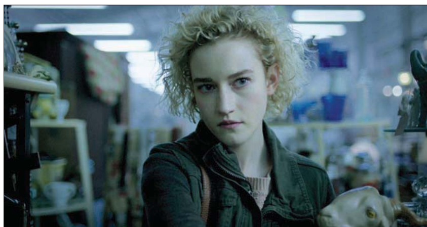
جوليا غارنر من مسلسل «أوزارك»

كيت بلانشت عن «فار» حيث أدت شخصية قائدة أوركسترا تواجه اختياراً حاسماً. أوليفيا كوفن عن دورها الرائع لمرأة في منتصف العمر تقع في الحب من جديد في «Empire of Light».