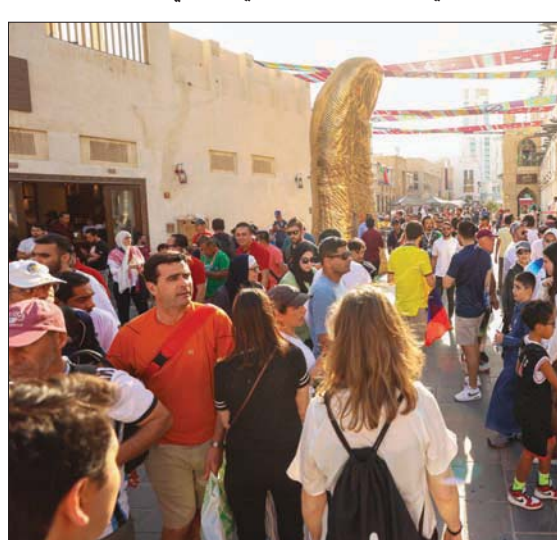
سوق واقف شهدت تجمعات حاشدة للعديد من مشجعي منتخبات المونديال

اللجنة العليا للمشاريع والإرث عام 2011 لتحتوي مسؤولية تنفيذ مشاريع البنية التحتية اللازمة لاستضافة نسخة تاريخية باهرة من بطولة كأس العالم لكرة القدم في قطر عام 2022، ووضع المخططات، والقيام بالعمليات التشغيلية التي تجربها قطر كدولة مستضيفة للنسخة الأولى من المونديال في العالم العربي والشرق الأوسط، بهدف الإسهام في تسريع عجلة التطور وتحقيق الأهداف التنموية للبلاد، وترك إرث دائم لدولة قطر، والمنطقة، والعالم. من جانبه امتدح حاتم الطرابلسي نجم منتخب تونس السابق التنظيم القطري للمونديال مؤكداً أنه رغم حملات التشكيك والتي كانت نوعاً ما مغرضة، استطاعت قطر أن تسترف كل الدول العربية