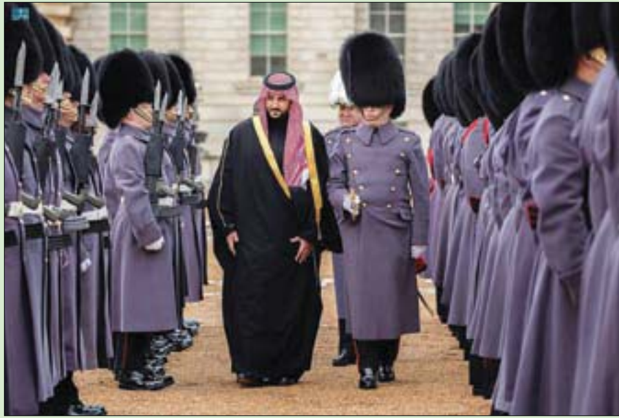
الأمير خالد بن سلمان مستعرضاً حرس الشرف لدى وصوله إلى ساحة الخيالة الملكي في لندن

الدفاع البريطانية جرى خلاله استعراض العلاقات الاستراتيجية والتاريخية بين البلدين الصديقين، وبحث