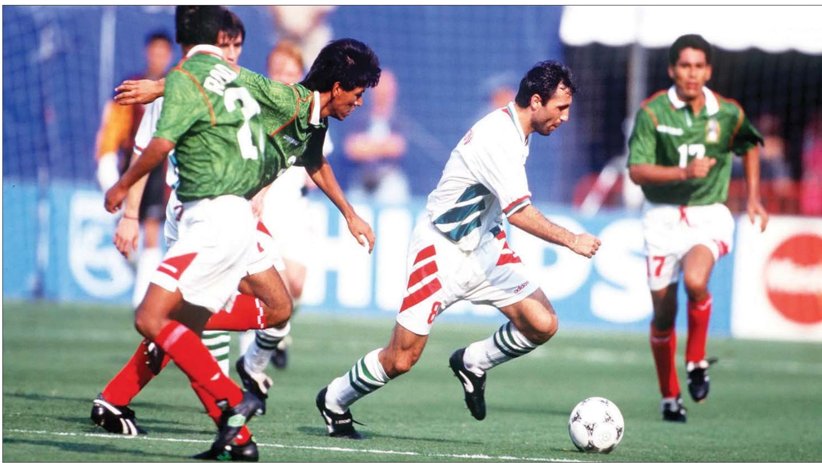
صورة أرشيفية للاعب ستويتشكوف الذي أوصل بلغاريا إلى المربع الذهبي في مونديال 1994

وتحدث زاهد في البداية عن ارتفاع سقف طموحاته بشكل تدريجي لمشوار المغرب في المونديال قائلًا، قبل دور المجموعات كنت أتوقع أن أتمنى التأهل لدور الستة عشر، وهو ما نجح فيه المنتخب المغربي، وبعدها كنت أشير إلى أن المنتخب المغربي سيذهب إلى ما هو أبعد من دور الستة عشر؛ لأنه قدم صورة جيدة، خاصة أنه تأهل من صدارة المجموعة وبناتج جيدة. واستهل المنتخب المغربي مشواره في المونديال بالتعادل سلبيًا مع منتخب