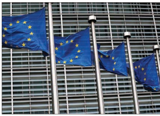
بروكسل تستضيف اجتماعاً أوروبياً - آسيوياً اليوم

العامة للأمم المتحدة. من هنا، فإن استحصال الأوروبيين على موقف أسيوي موحد يبدو صعباً اليوم. وأول من أمس، قالت مصادر قصر الإليزيه، في معرض تقديمها للأوروبيين يستشعرون الحاجة للاجتماع بنظرانهم من جنوب شرقي آسيا بعد جاتحة «كوفيد 19»، وعودة التواصل مع منطقة تتمتع بدينامية اقتصادية متميزة، وإظهار أن الحرب الدائرة في أوكرانيا ليست مسألة حكرًا على الأوروبيين؛ لأنها تدور على أراضٍ أوروبية، بل تهم العالم جمعاً لجهة تبعاتها المتنوعة سياسياً واستراتيجياً واقتصادياً، ولأمن الطاقة والغذاء العالميين.