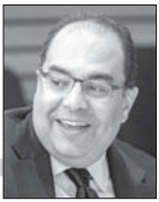
د. محمود محيي الدين

التي صارت واحدة منها «قديمة» والأخرى «جديدة» ربما سوف يكون فيه الكثير من الخطأ التحليلي، لأن العالم نعم تغير، ولكنه لا يعيد نفسه كما تفعل الشمس كل صباح. التغيير ظاهرة مركبة، وفي تركيبها يكون هناك الكثير من الحدة، وفي هذا الاتجاه صك عالم السياسة الدولية الأميركي جوزيف ناي، تعبيراً جديداً يضاف إلى