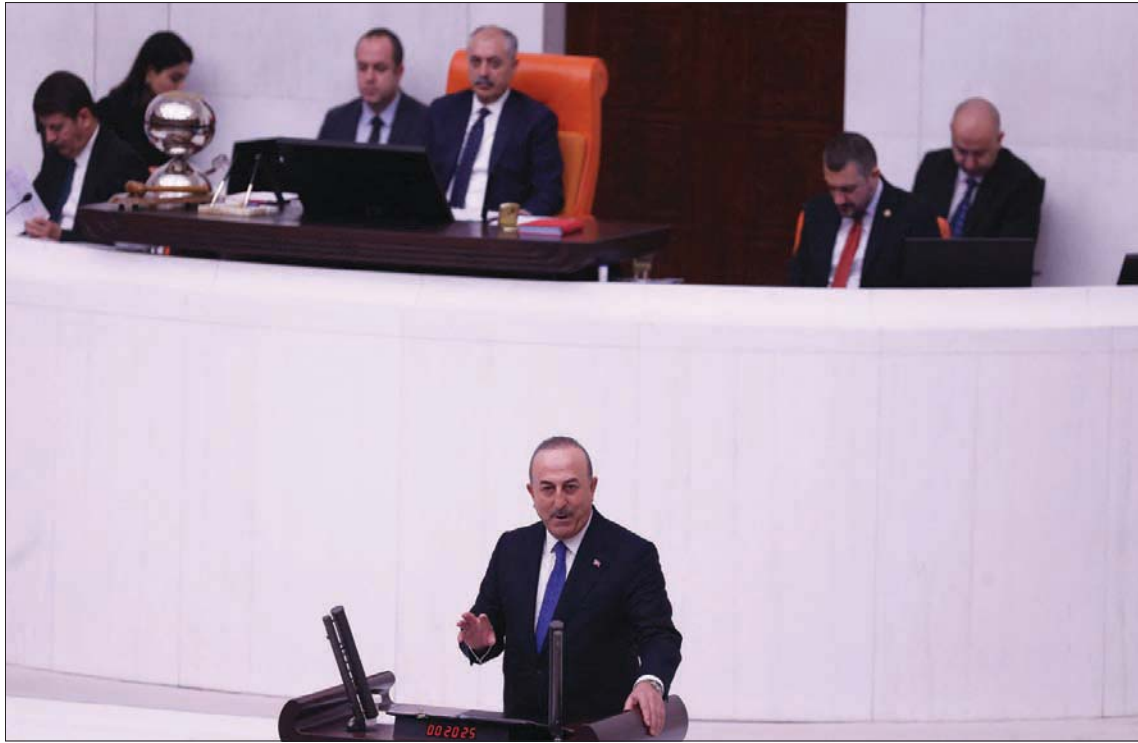
جاويش أوغلو تحدث عن الاتصالات الاستخباراتية مع سوريا خلال مؤهله أمام البرلمان في أنقرة ليلة الاثنين- الثلاثاء (أ.ف.ب)

وبذلك يصل إجمالي مساعدات الاتحاد الأوروبي المعتمدة في عام 2022 إلى 1,235 مليار يورو، مواصلة دعم اللاجئين في تركيا، وتلبية الاحتياجات الأساسية لهم، ومساعدة الفئات الأكثر ضعفاً.