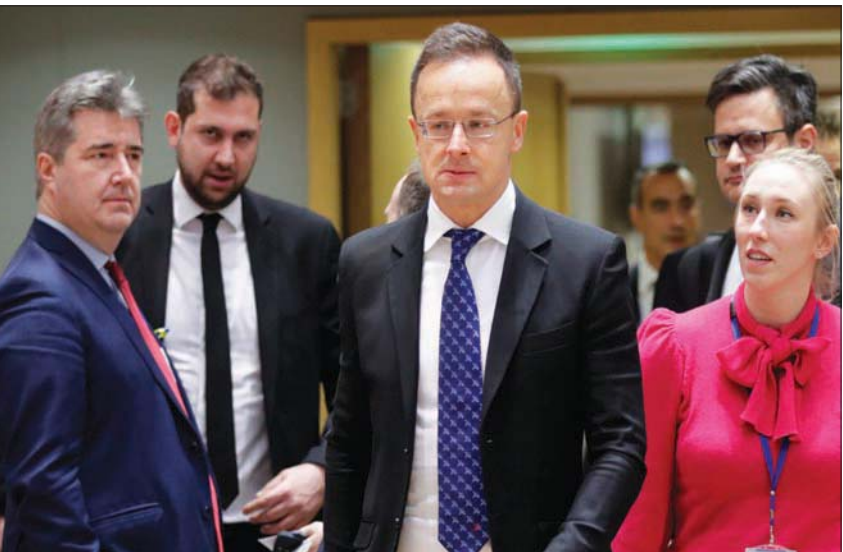
وزير الخارجية والتجارة المجري بيتر سيجيراتو (وسط) في بروكسل مساء الاثنين (أبأ)

بروكسل، «الشرق الأوسط» اتفقت الدول الأعضاء في الاتحاد الأوروبي على توجيه أساسي لتطبيق الحد الأدنى العالمي لضرائب الشركات، بعد فترة طويلة من عرقلة المجر تمرير الاتفاق. وقال المجلس الأوروبي في بيان، عقب اجتماع للممثلين الدائمين للدول الأعضاء في الاتحاد الأوروبي في بروكسل في وقت متأخر من مساء الاثنين، إن «التطبيق الفعال للتوجه سيحد من المسابق (بين دول العالم) على تقديم تخفيضات ضريبية للشركات». كانت 137 دولة بينها الاتحاد الأوروبي والولايات المتحدة قد اتفقت في أكتوبر (تشرين