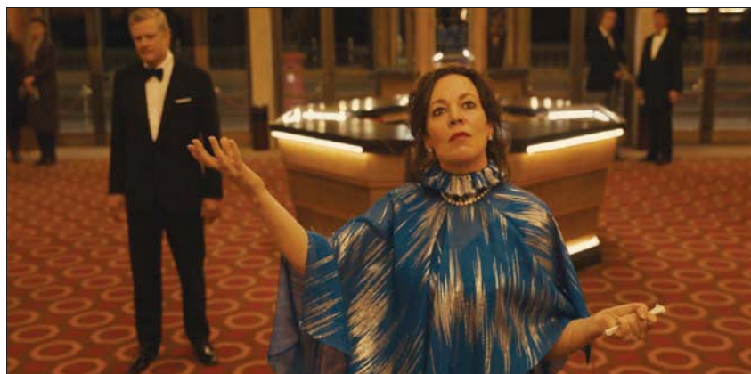
أوليفيا كولمان في «إمبراطورية الضوء»

كل من أنا دي أرماس، وأوستن باتلر يمثلان شخصيتين حقيقيتين (مارلين مونرو، والفيس إنيشيرين)، وكى هوي كوان في