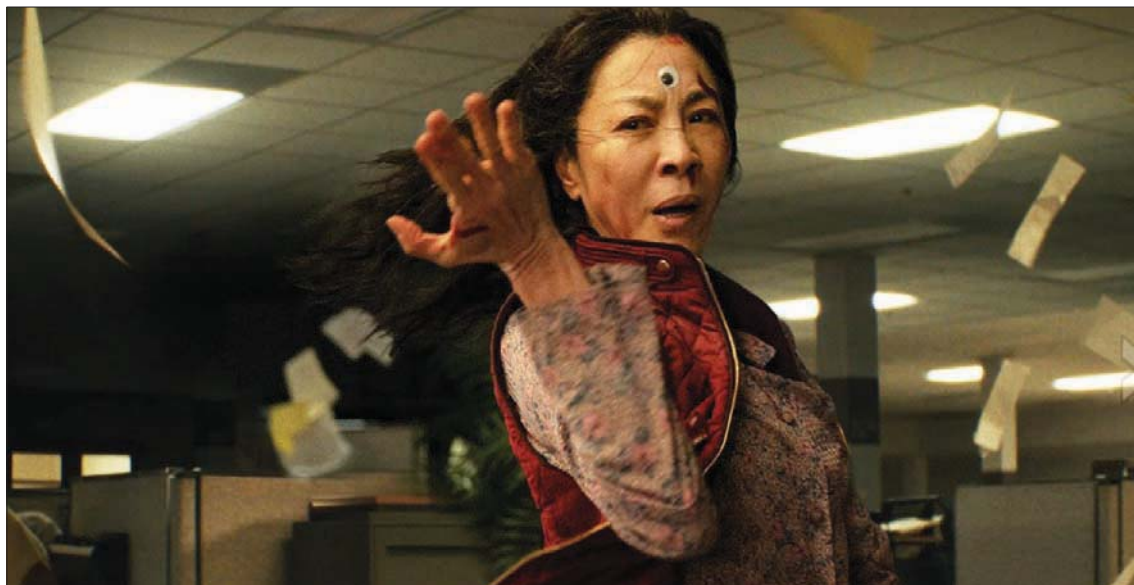
ميشيل يوه مرشحة عن «كل شيء كل مكان في وقت واحد»

في نطاق التمثيل الدرامي النسائي نجد الاسماء التالية: