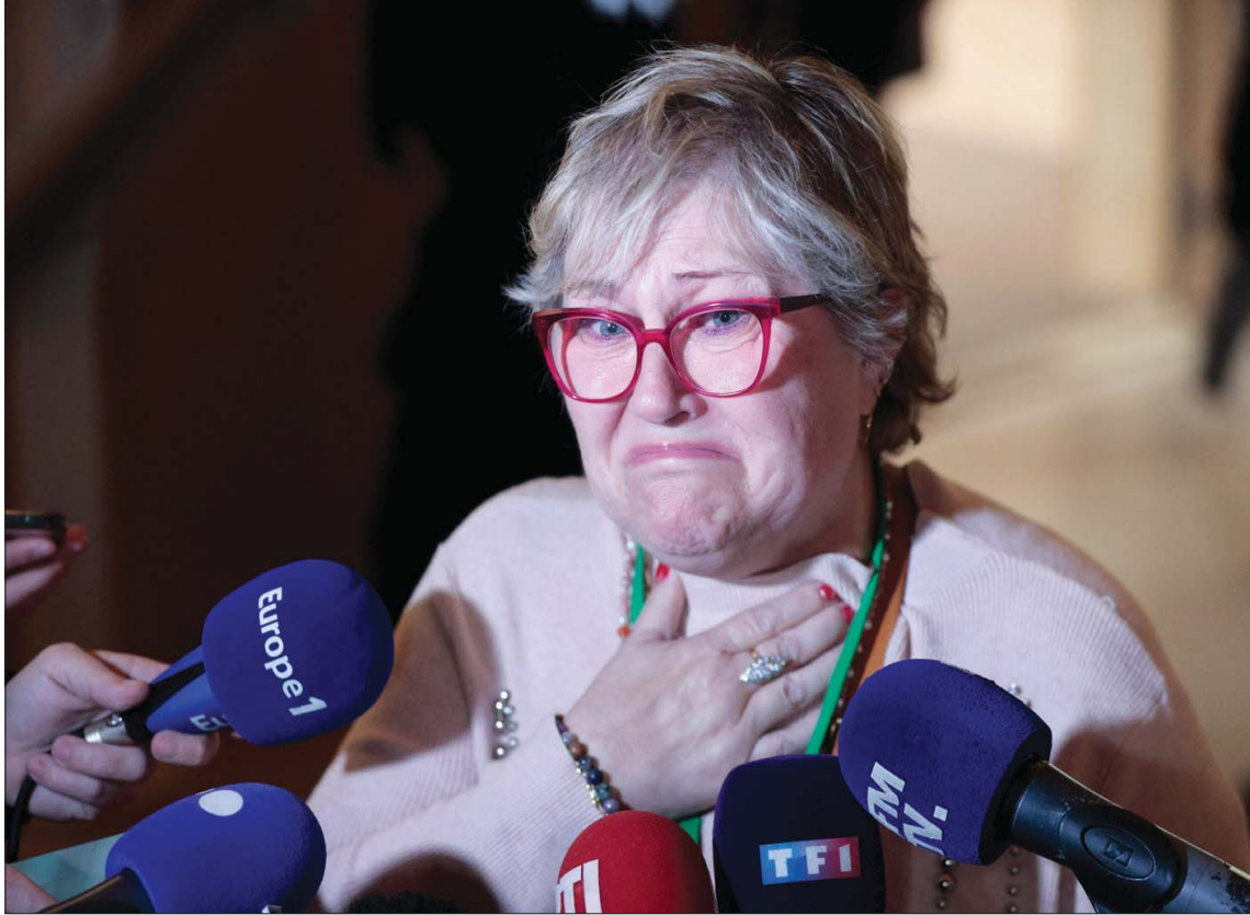
ناجية من هجوم الدهس في نيس تتحدث إلى الصحافيين عقب صدور حكم الإدانة ضد المتهمين الثمانية أمس

قالت محكمة فرنسية، أمس الثلاثاء، إن المتهمين الثمانية الذين حوكموا بشأن هجوم بشاحنة في الحلال، بعد أن مدينة نيس الفرنسية، مذبون لادوارهم في الجريمة التي قتل فيها 86 شخصاً، حسبما ذكرت وكالة «رويترز».