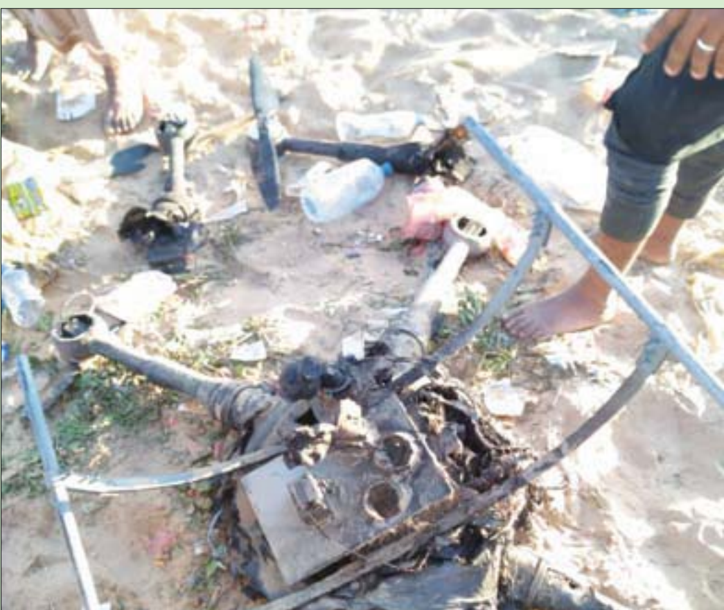
«درون» حوثية أسقطها الجيش اليمني في مارب

واصلت الميليشيات الحوثية في اليمن انتهاكاتها من خلال قصف مدرسة في محافظة حجة (شمال غرب) بطائرة مسيرة، ما نجم عنه مقتل طفل وإصابة اثنين آخرين، وفق ما أفادت مصادر حكومية رسمية.