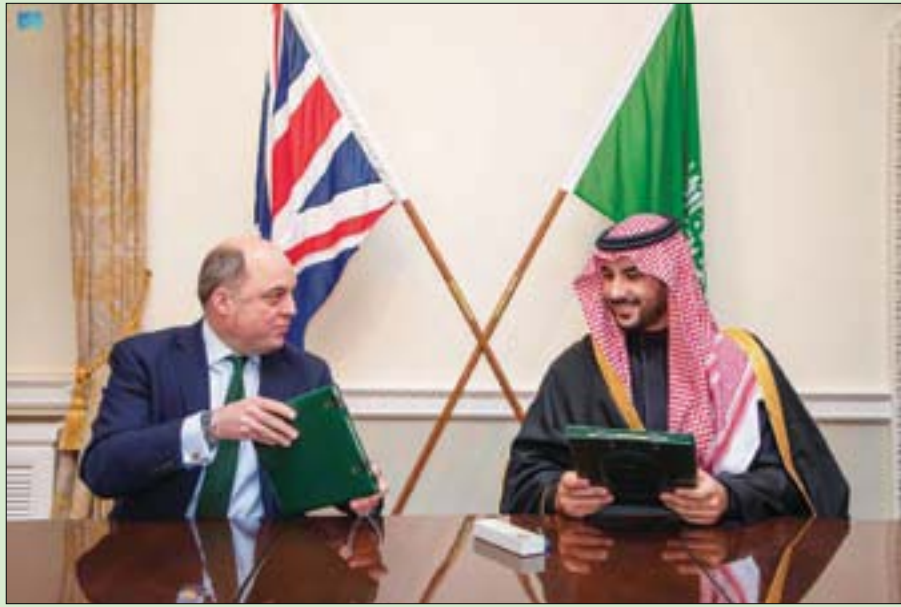
الأمير خالد بن سلمان والوزير بن والاس عقب توقيع الاتفاق

وكان وزير الدفاع السعودي وصل، والوفد المرافق له، إلى المملكة المتحدة أول من أمس، في زيارة رسمية يلتقي خلالها عدداً من المسؤولين لبحث العلاقات بين البلدين، وتعزيز التعاون الثنائي في المجال العسكري والدفاعي، ومناقشة القضايا ذات الاهتمام المشترك على المستويين الإقليمي والدولي.