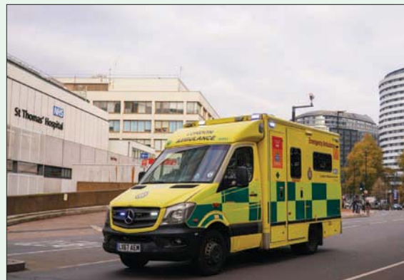
لندن، الشرق الأوسط،

على نشرة الأخبار في قناة «سكاي نيوز» تبسو صفحة شهر ديسمبر (كانون الأول) في الروزنامة مليئة بالأشغال، كل مربعاتها ملونة وكل لون له مفتاح يشرح لنا أحداث اليوم، ليست أحداثاً مرتبطة بموسم الأعياد بل هي مرتبطة بموجة غضب عامة تسود المملكة المتحدة منذ أشهر.