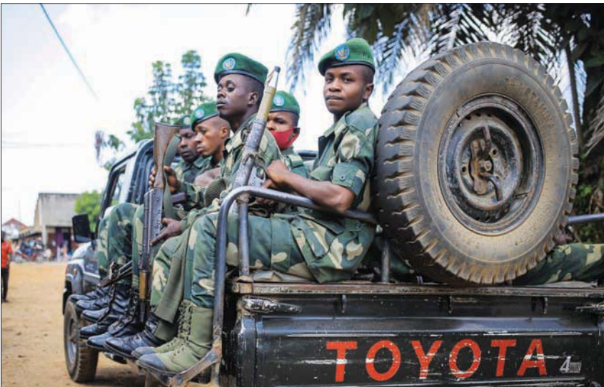
جنود من الكونغو في دورية بمنطقة بني بعد استعادة رهائن كانوا محتجزين لدى جماعة القوات الديمقراطية المتحالفة، في 3 ديسمبر الحالي

حقت نجاحات كبيرة، لكن الجماعة المسلحة ما زالت تهاجم المدنيين. وفي ترتيب منفصل الشهر الماضي، قالت أوغندا إنها ستشن 1000 جندي إضافي للاضطلاع على قوة إقليمية مكلفة بالمساعدة في إنهاء حالة عدم الاستقرار المستمرة في شرق الكونغو منذ عقود.