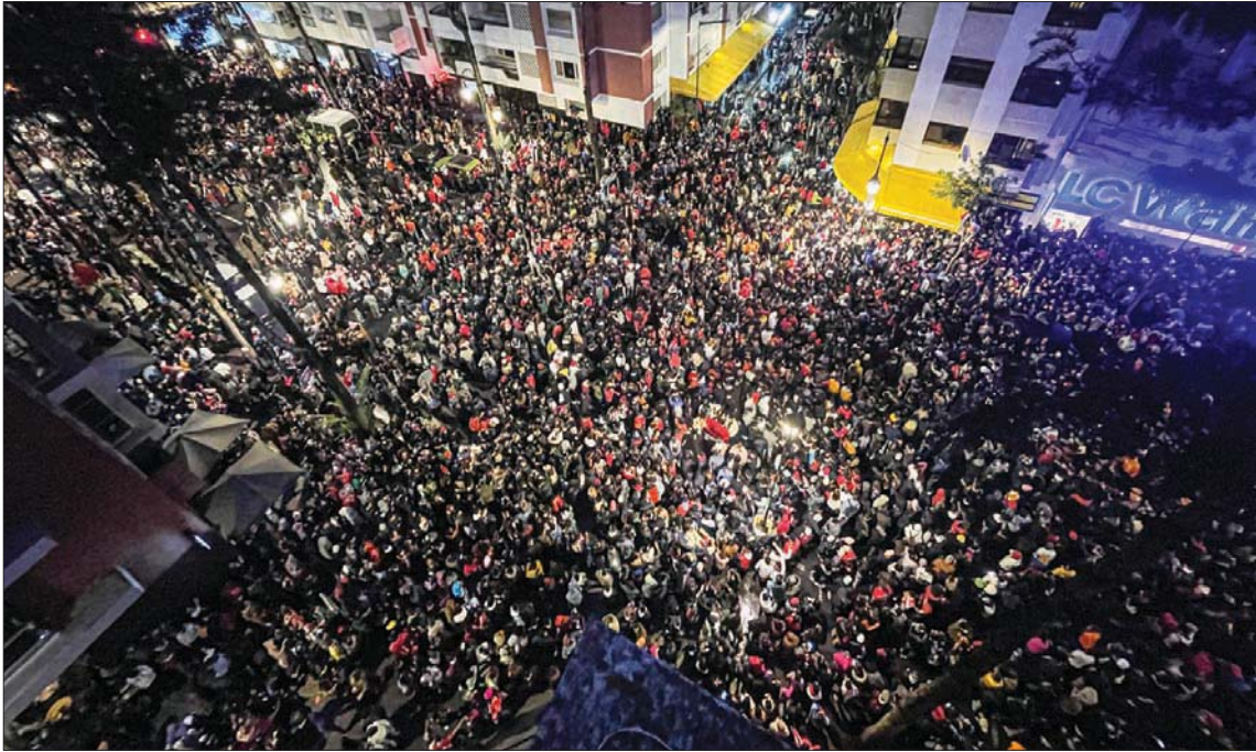
جانب من احتفالات المغاربة في مدينة الرباط بتأهل فريقهم إلى المربع الذهبي في مونديال قطر