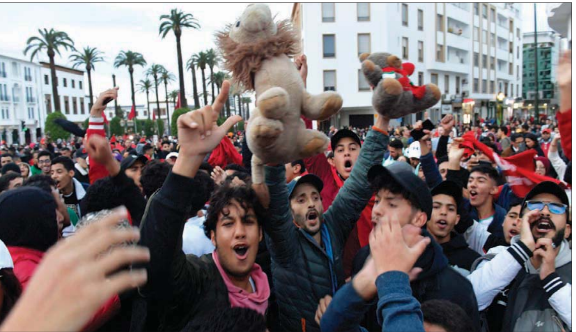
مشجعو «أسود الأطلس» يحتفلون في الرباط بفوز المنتخب المغربي على نظيره البرتغالي وصعوده إلى الدور النصف نهائي في ألبلياد قطر

ليس بلد غروب. هو بلد شروق وإشراق، بلد يقطر على الكرم، ويتغدى على المعرفة، وينام على الحب والوصل. بلد حضارات متعاقبة، ولغات شتى، وأمشاج من أقوام، هو حاضن للغرباء، وبيتا للمضطربين من رحمة الدين والسياسة، إذ منذ القرن الأول للميلاد، وعلى أرضه أقيمت ممالك، وسلطت حضارات، وإن كانت زالت، فقد ظلت عاشقة في قلوب وأرواح المغاربة. المغرب، بلد أحبه كثيراً، لي فيه إخوة وأصدقاء كبار في الشعر والرواية والفلسفة والنقد والنصوف والموسيقى والفن التشكيلي والمسرح، بل شرفني العشرات من كبار مبدعيه ونقاديه بنقد وقراءة تجربتي الشعرية، ولن أقول إنني مدين لهم بشيء، إذ عندما أمشي وحيداً أو برفقة أصدقاء في أحد شوارع أي مدينة مغربية، أشعر بأن هذه الأرض لي، وأنا منها، لي فيها إرث وحرف ونشيد ضائع غريب منسى على استرجاعه، إذ تمنحني وجوداً، ومحمية، وقديماً قيل: المكان بأهله، وأهل