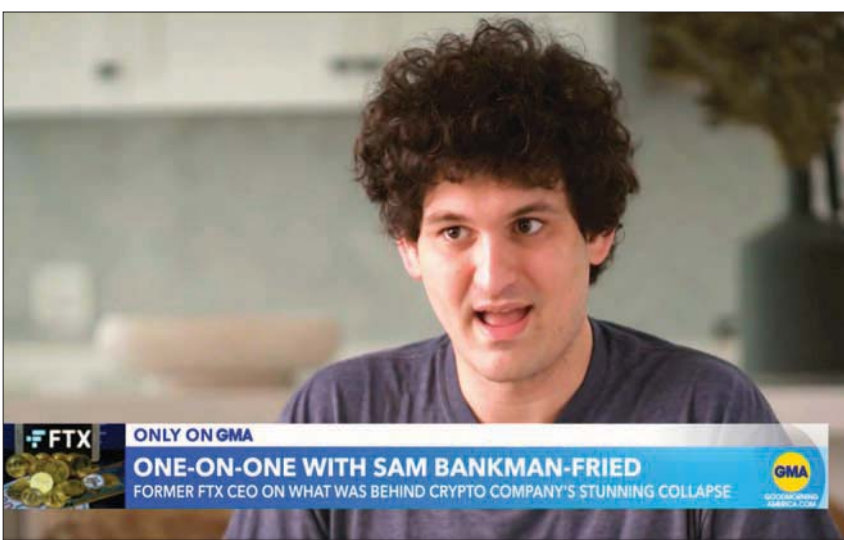
سام بانكمان - فريد خلال ملاحظة مع قناة «إيه بي سي نيوز» الأمريكية في وقت سابق هذا الشهر

أي نيّة إحتيالية. وكانت «إف تي إكس» تقدّمت في 11 نوفمبر (تشرين الثاني)، على طلب لوضعها تحت قانون الإفلاس، بينما كانت تواجه نقصاً كبيراً في السيولة وسيلاً ومؤخراً، قال بانكمان - فريد إنه «ضد» بتفاصيل كثيرة تكشف عن انهيار منصة العملات المشفرة، مؤكداً أنّ المشاكل نجمت عن تراخي الرقابة والضوابط في الشركة، وليس عن