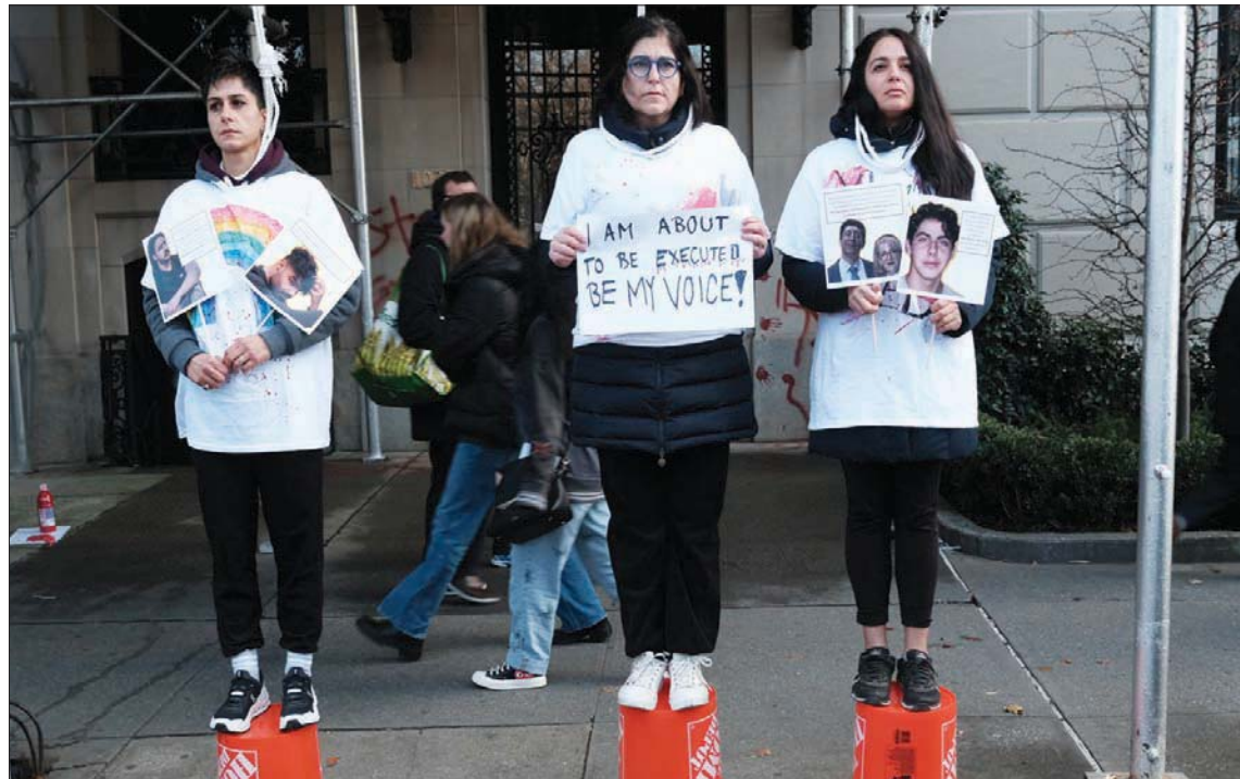
إيرانيات يتظاهرن في نيويورك السبت الماضي رفضاً للإعدام في بلادهن

القيادة في الجمهورية الإسلامية «تخشى شعبيها». وقال المتحدث باسم وزارة الخارجية الأمريكية نيد برايس لصحافيين الاثنين: «هذه الأحكام القاسية والأولاد إعدام علي (مرتبط بالاحتجاجات) تهدف إلى تخويف الشعب الإيراني. تهدف إلى إسكات المعارضة وتظهر بساطة إلى حد تخشى القيادة الإيرانية شعبيها».