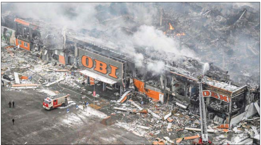
حريق في مركز تجاري قريب من موسكو قيل أن أسبابه غامضة

ولم تقتصر الملاحقات الأمنية، خلال الأشهر العشرة الماضية، على الأشخاص والأجهزة الأمنية «المعادية»، كما دلت التقارير القادمة إلى الاجتماع، حبراً مهماً في النشاط الروسي الموجه لمواجهة «حملات التضليل» الخارجية. في هذا الإطار تم إعلان أنه منذ بدء العملية العسكرية الخاصة في أوكرانيا، كتفت لجنة مواجهة الإرهاب عملها في المجال الإعلامي. وتم حجب أكثر من 3,5 ألف من مصادر الإنترنت التي «نشرت معلومات كاذبة حول مسار العملية الخاصة وأعمال القوات المسلحة الروسية».