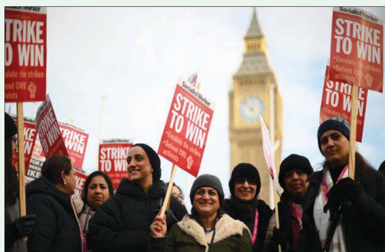
إضراب عمال البريد تسبب في أزمة