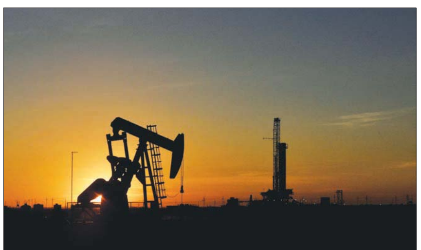
مضخة تعمل أمام منصة حفر في حقل نفط في ميدلاند الأمريكية

سعر إعادة الشراء النظري، وهو 70 دولاراً، الذي أعلنه الرئيس الأميركي جو بايدن أنه يهدف إلى تجديد مخزونات الخام عند الوصول إليه، وهو ما دعم أسعار النفط في جلسة أمس الثلاثاء. ودعم ارتفاع الأسعار، التراجع الذي شهده الدولار أمس، بعد بيانات تباطؤ التضخم في الولايات المتحدة بأكبر مما كان متوقعاً في نوفمبر، ما يتبع للاحتياطي الفيدرالي إبطاء عمليات زيادة معدلات فائدته الأساسية. وقال كيرج إيزرلام، كبير محللي السوق في مؤسسة أواندا، وفق رويترز، إن «المزيد من الدعم للأسعار جاء من خلال تراجع قيود مكافحة كورونا في الصين وتهديد روسيا بخفض الإنتاج في مواجهة الحد الأقصى للأسعار من جانب مجموعة السبع، إلى جانب إغلاق خط إمدادات رئيسي إلى الولايات المتحدة». ولم يُجدد جدول زمني باستئناف الإمدادات عبر خط أنابيب كاستون التابع لشركة تي سي إيجري، الذي يتم من خلاله شحن حوالي 620 ألف برميل يومياً من الخام الكندي من البرتا إلى الولايات المتحدة بعد غلقه الأسبوع الماضي.