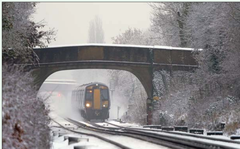
تسببت موجة طقس بارد في سقوط الثلوج وتعطيل حركة المرور (د.ب.أ)