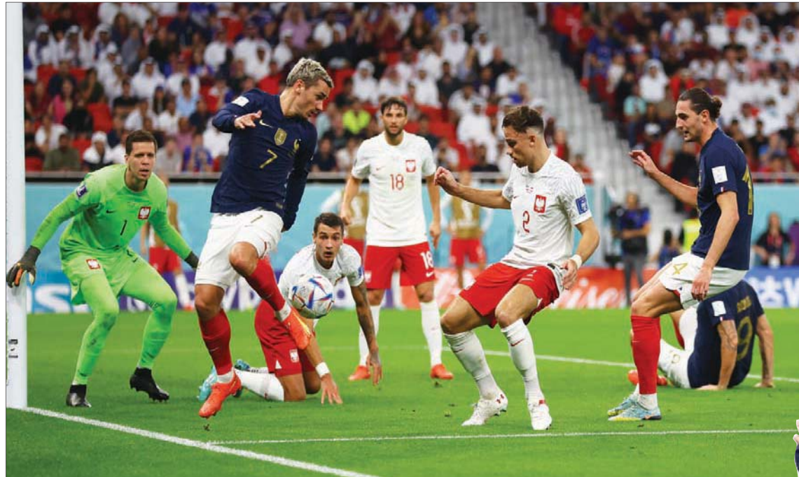
غريزمان يلعب دوراً مختلفاً تماماً مع منتخب فرنسا في كأس العالم الحالية

ومع ذلك، ربما يؤدي عدم إلمام غريزمان بمتطلبات هذا المركز إلى ارتكاب بعض الأخطاء، فعندما حصل على بطاقة صفراء في نهاية الشوط الأول أدى ذلك إلى أن يلعب بحذر شديد للغاية في بداية الشوط الثاني، خشية أن يحصل على بطاقة صفراء أخرى. ولم يكن من قبيل الصدفة أن هذه هي الفترة التي سيطر فيها المنتخب الإنجليزي على مجريات اللقاء، لكن غريزمان عاد للتوجه من جديد في الجزء الأخير من المباراة، وتحرك في جميع أنحاء الملعب لكسر إيقاع المنتخب الإنجليزي، ومساعدة فريقه على الخروج بالكرة إلى الأمام، وتبادل الكرات