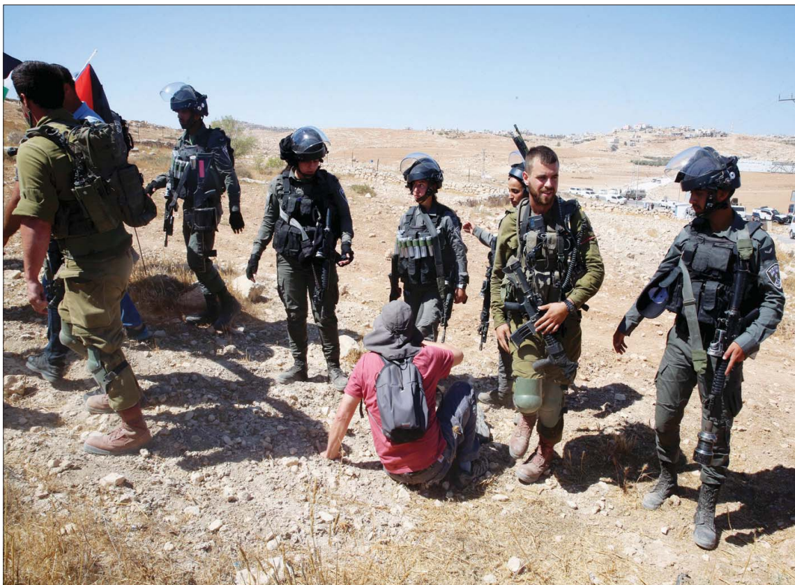
فلسطيني يحتج ضد توسع المستوطنات الإسرائيلية قرب الخليل بالضفة في 17 سبتمبر

وقفت في مركز الاقتراع وأدليت بصوتك لهم، هل هذا ما صوت له؟ هل هذا ما تريدونه؟ أن يتم تشكيل الحكومة الأكثر تطرفاً في تاريخ البلاد من خلال تصويتك. هل أردت أن يتمكن إيتبار بن غفير، المجرم العنيف الذي أدين بدعم الإرهاب، من إصدار أوامر للشرطة بعدم اعتقال الشبان من يتسارعون الذين يرشقون جنود الجيش الإسرائيلي بالحجارة؟ هل تريدون حقاً أن تعيش في دولة بها شرطة سياسية يسيطر عليها اليمين المتطرف؟» وأضاف لبيد قائلاً: «هذه ليست حكومة ليكود، إنها ليست لتأكيد ليست حكومة نتخاها. نتخاها ضعيف، وخائف من محاكمته، استولى عليه من هم اصغر منه، أكثر تطرفاً وحرماً منه. يسيطر سموتريش ودرعي على هذه الحكومة. نتخاها شريك صغير».