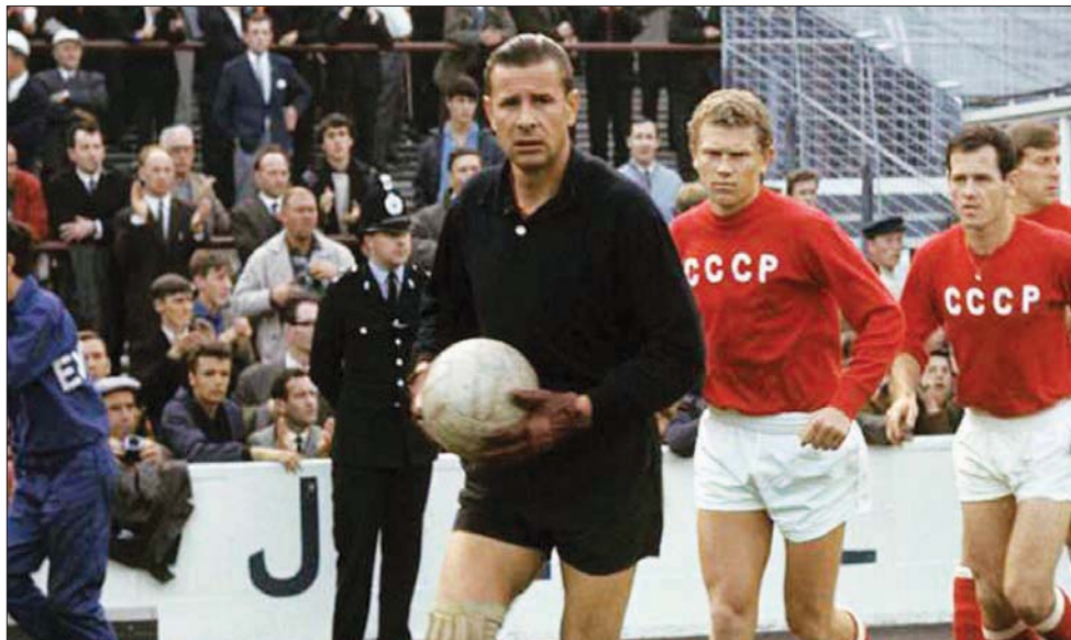
صورة أرشيفية للحارس «الأسطوري» لمنتخب الاتحاد السوفييتي عام 1996 ليف ياشين.

تخلصت من السنغال بالهدف الذهبي (1 - 0) بفضل هدف إيلهان مانسين، قبل الاستسلام أمام البرازيل وروندو (0 - 0) وفاز الأتراك بمباراة المركز الثالث (3 - 0) واحترام الجميع بإنجازه التاريخي في