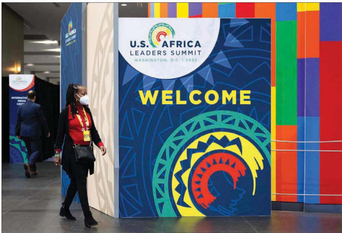
مركز مؤتمرات «التر إي واشنطن» حيث تعقد القمة الأميركية - الأفريقية

واشنطن، هبة القديس إلى القارة الأفريقية خلال عام 2023.