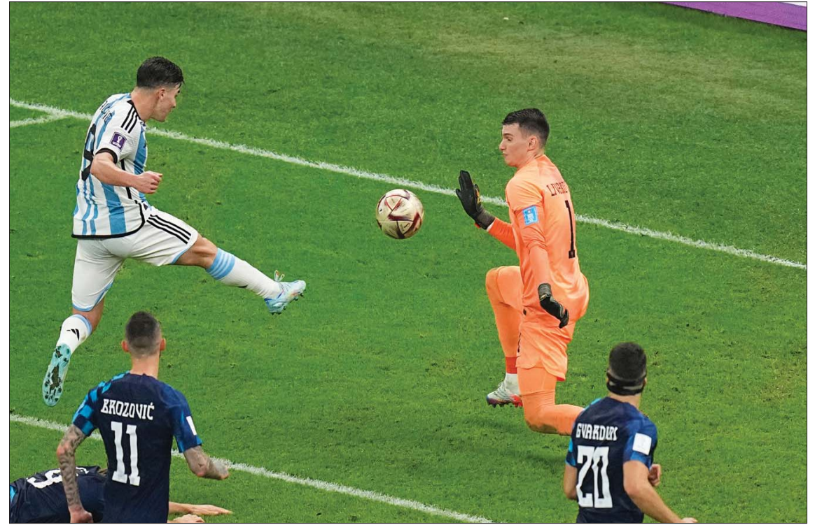
الفايزين سجل هدفه الأول في المباراة بمجهود شخصي رائع

الكرواتي ليفاكوفيتش كهدف أرجنتيني ثاب عند الدقيقة 38. ورغم أن الاستحواذ كان كرواتياً طوال فترات الشوط الأول، فإنها كانت دون خطورة على شباك الحارس البرازيلي مارتينيز، في الوقت الذي كان لاعبو التانغو يخطفون هدف ثالث قبل نهاية المباراة من ضربة ركنية أبعدها الدفاع الكرواتي. وقبل نهاية الشوط هدد لاعبو كرواتيا شباك البرازيلي مارتينيز في أول تهديد حقيقي لمرماه قبل أن يحتسب حكم المباراة 4 دقائق كوقت ضائع لم يستثمرها الكروات في التسجيل.