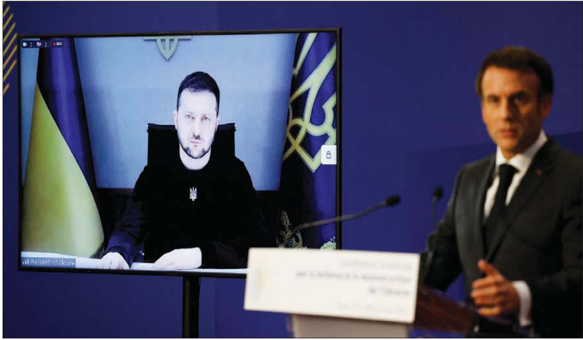
ماكرون يقدم الرئيس الأوكراني للمؤتمر عبر تقنية الفيديو كونفرنس

باريس، ميشال أبو نجم نجحت فرنسا في رهان الدعوة إلى مؤتمر دولي عالمي المستوى للإسراع في مد يد المساعدة لأوكرانيا من أجل تمكينها من اجتياز فترة الشتاء القاسي، فيما القوات الروسية تواصل استهداف منشآت الطاقة الحيوية وبنائها التحتية. وفيما قدر الرئيس الأوكراني، في مداخلة أمام المؤتمرين عبر تقنية الفيديو (نيسان) القادم، وحرصت الوزارة جانبها رئيس وزراء أوكرانيا دونيس شميشال، أن مجموع الالتزامات التي قدمت بمناسبة المؤتمر زادت على مليار يورو والرقم الدقيق هو 1,05 مليار يورو يعني أن يتم استخدامها قبل حلول شهر أبريل (نيسان) القادم، وحرصت الوزارة كاترين كولونا على الإشارة إلى أن هذا المبلغ ليس فروضاً بل «هبات جديدة» بغض النظر عن المساعدات الأخرى التي تقدمها مجموعة الدول الداعمة لأوكرانيا. ووفق كولونا والرياسة الفرنسية، فإن الأساس من هذا المبلغ سيخصص لقطاع الطاقة وخصوصاً توفير التيار الكهربائي. ودايت القوات الروسية، منذ شهر أكتوبر (تشرين الأول) الماضي، على استخدام محطات الطاقة والشبكة الكهربائية الأوكرانية والبنية التحتية الأخرى. وفي كلمته الافتتاحية، شدّد ماكرون على أن الأموال المجموعة يجب أن تخصص، بالاتفاق مع سلطات كييف، لخمسة قطاعات هي، إلى جانب الطاقة، المياه والصحة والنقل والغذاء، والهدف الذي يسعى إليه المؤتمر هو مواجهة الاستراتيجية الروسية القائمة على «ترويع الأوكرانيين وإضفاء قدرتهم على المقاومة»، ويحسب ماكرون فإن روسيا «تستعيب عن ضعفها العسكري باللجوء إلى استراتيجيات ضرب البنى التحتية من أجل تركيبة أوكرانيا»، مضيفاً أن كل هزيمة ميدانية تلحق بالقوات الروسية تتبناها ضربات لنشآت الكهرباء والغاز والمياه، وأن ذلك «يشكل جرائم