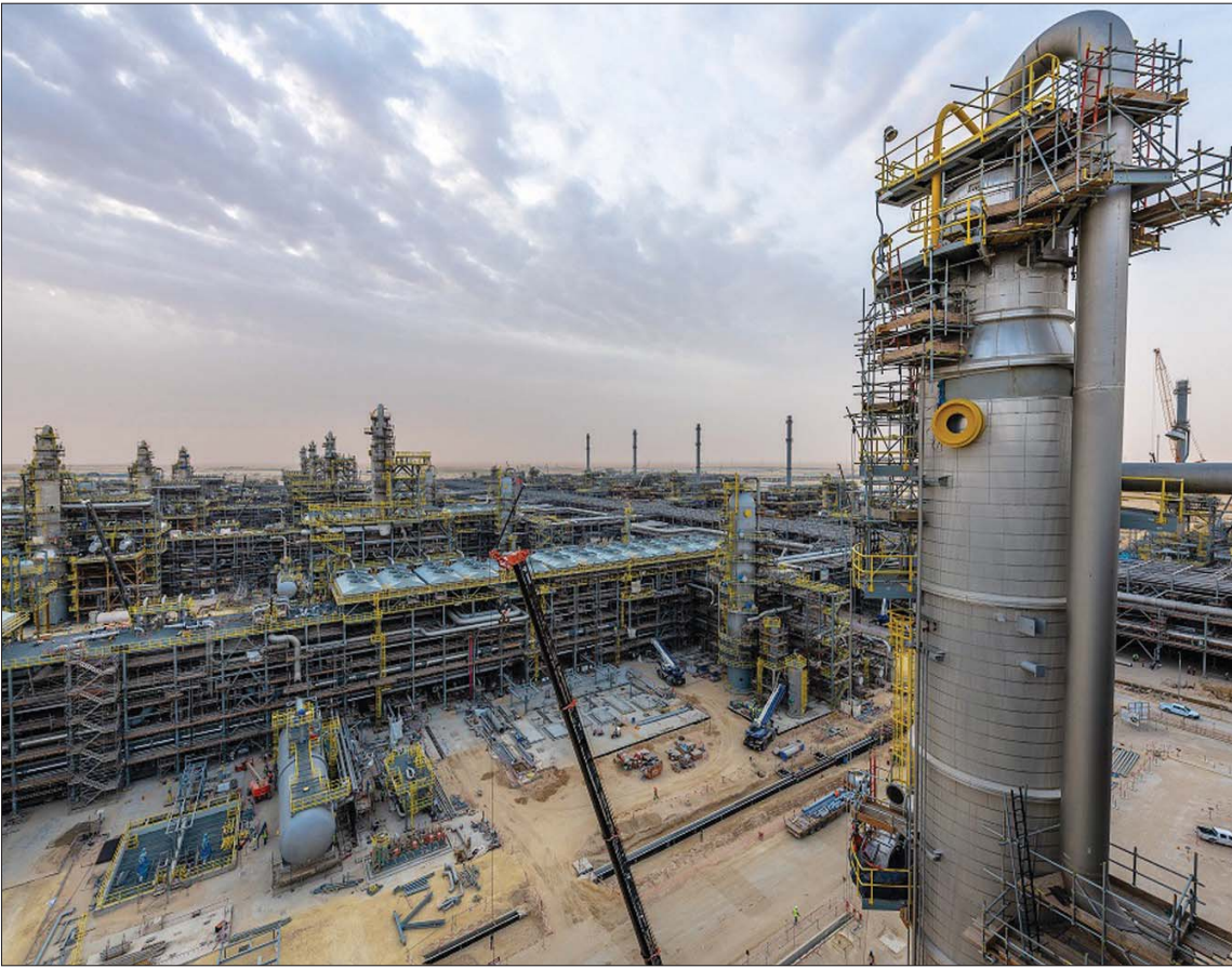
السعودية لتطوير أعمال إنتاج الغاز الطبيعي لتصبح من أكبر المنتجين على مستوى العالم (الشرق الأوسط)

الظهور عبر النتائج المالية على مراحل متزامنة مع الأعمال المتعلقة بتطوير الحقل. وفي 2020 كشفت الحكومة السعودية، بشكل رسمي، عن تطوير حقل الجافورة العملاق في المنطقة الشرقية، وهو أكبر حقل للغاز غير المصاحب غير التقليدي يتم اكتشافه في المملكة، ويقدر حجم موارد الغاز في مكانه بنحو 200 تريليون قدم مكعبة من الغاز الرطب الذي يحتوي على سائل الغاز ذات الأهمية في الصناعات البتروكيمياوية والمكثفات ذات القيمة العالية. وبالسعودة التي تاريخ السعودية في الغاز، بدأت الحكومة في استخراج المنتج واستخدامه لتطوير منتجات الزيت منذ منتصف سبعينات القرن الماضي، تحديداً عام 1975، حين طلعت وزارة الطاقة (البحرول والثروة المعدنية حينها) من شركة «أرامكو» تصميم وتشغيل شبكة متكاملة لتجميع ومعالجة ونقل الغاز الطبيعي المصاحب لإنتاج الزيت الخام (شبكة الغاز الرئيسية).