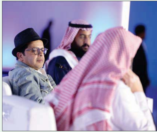
محمد هنيدي في ندوة مراحل الكوميديا (الشرق الأوسط)

الناس، لافتاً إلى أن الممثل الكوميدي على منصات التواصل الاجتماعي يختلف كثيراً في عمله عن الممثل في الأفلام والمسلسلات ذات الطابع الكوميدي، حيث إن ممثلي التواصل يعتمدون على المقاطع الصغيرة والسريعة. وأضاف هنيدي «تاريخ الكوميديا قديم، ويعتمد على فكاهة الشعوب أنفسها، وفي عصرنا هذا تعتبر مزهجرة جداً، لكثرة المواقف التي تبني من خلالها المشاهد الفكاهية، فالكوميديا لها شكل واحد لا يختلف بين المجتمعات، ولكن يختلف في اللهجة، ومن جانبها، بين الممثل