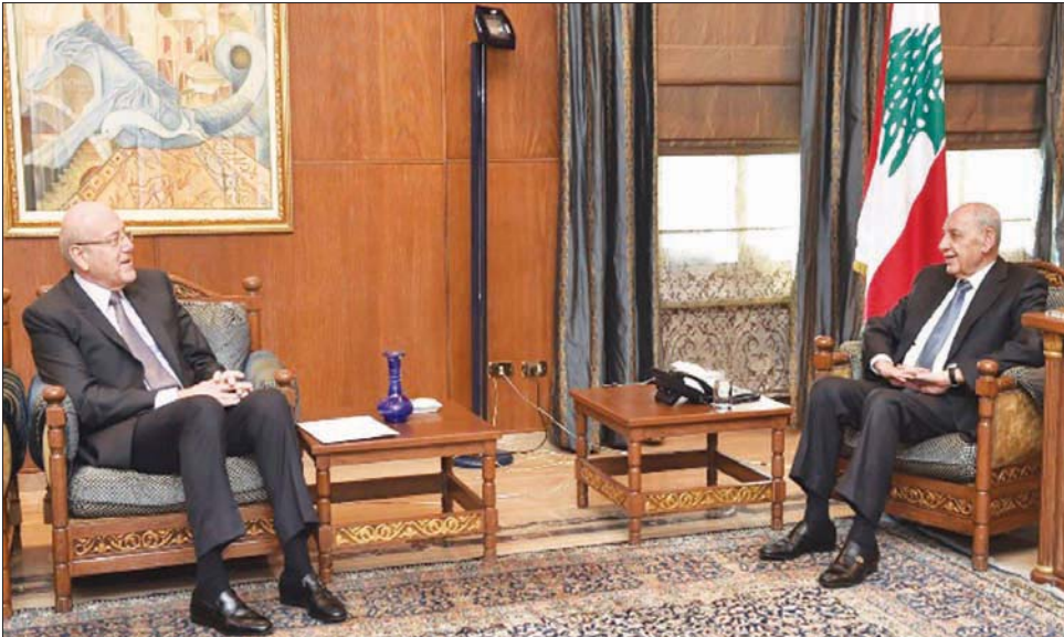
الرئيس نبيه بري مستقبلاً رئيس الحكومة نجيب ميقاتي أمس

وأضافت: «بمعزل عن الدخول في نيات الداعي إلى الحوار، ولا أيضاً في نيات من سيلتوّن دعوته، ترى (القوات اللبنانية) أن استبدال جلسات انتخاب الرئيس من قبل مجلس نيابي أصبح في حالة انعقاد دائم بحسب أحكام