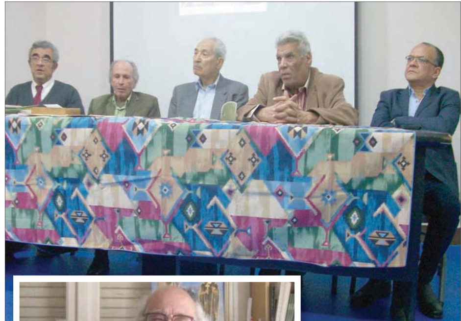
لقطة من الاحتفالية

التي كان يمثلها كامل، الذي أرى أنه كان أهم من نجيب محفوظ حينما بدأ معاً، والدليل على ذلك أن رواية عادل كامل التاريخية (ملك من شعاع) لا تزال أفضل من روايات محفوظ التاريخية الغثال المعروفة، وحين انتقل للرواية الواقعية، وكتب (مليم الأكبر) قدم عملاً يعتبر علامة إبداعية في تاريخ الأدب المصري، هذا إضافة لإسهاماته المهمة في القصة القصيرة والمسرح، وقد أشرت إلى ذلك في دراسة نشرتها قبل 58 عاماً».