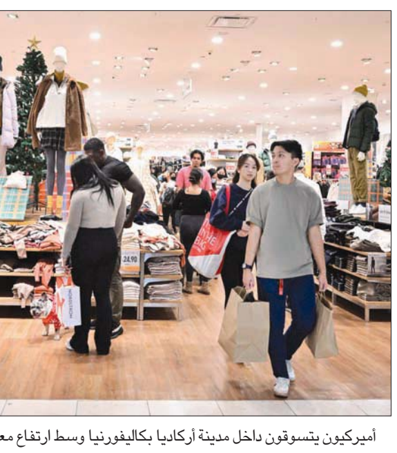
أميركيون يتسوقون داخل مدينة أركاديا بكاليفورنيا وسط ارتفاع معدلات التضخم

بروكسل، الشرق الأوسط رأت رئيسة المفوضية الأوروبية أورسولا فون دير لاين أن الاتحاد الأوروبي يجب أن يتخذ إجراءات من أجل إزالة «نقاط الخلل» في المنافسة التي نجمت عن الإعانات الأميركية الهائلة لخطة المناخ الكبيرة لجو بايدن. وقالت فون دير لاين في كلمة في مؤسسة «كوليج دو لوروب» في مدينة بروج ببلجيكا إنه بالترافق مع العمل مع الولايات المتحدة لحل أكثر الجوانب إشكالية» في خطتها، «يجب علينا تعديل قواعدنا لتسهيل الاستثمار العام في التحول البيئي. وأضافت المسؤولة الأوروبية «علينا إعادة تقييم الحاجة إلى تمويلات أوروبية» مشتركة. وكان الاتحاد الأوروبي عبر