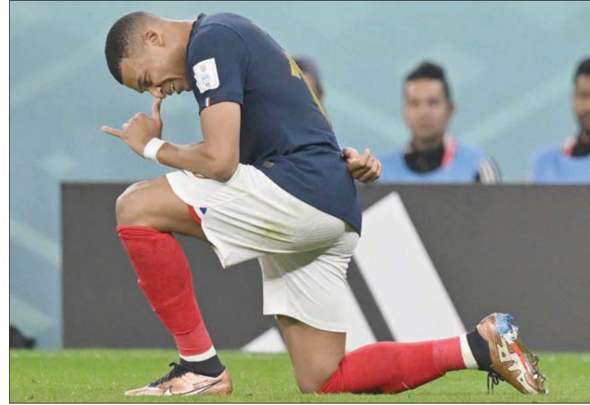
مبابي يحتفل بعد هدفه الثاني في مرمى بولندا

وسنحت فرصة خطيرة لبولندا أمام مهاجمها بيوتر جيلينسكي، الذي