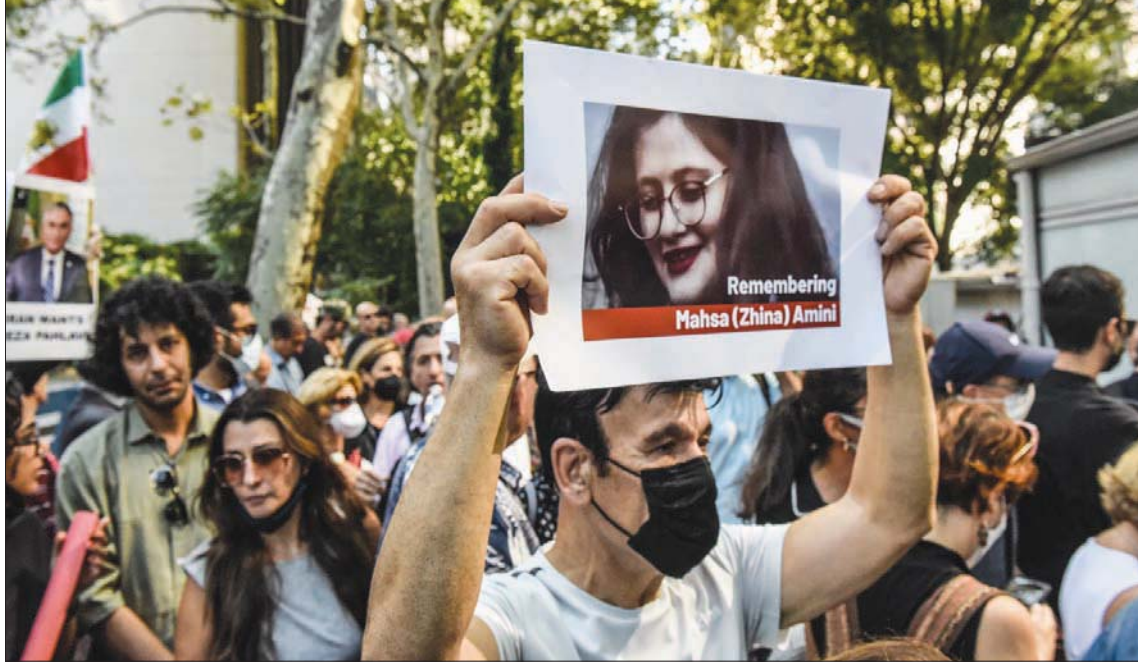
صورة مهسا أميني حاضرة في الوفيات الاحتجاجية داخل إيران وخارجها (أ.ب)

صحافية سابقة لقائد «شرطة الأخلاق» العقيد أحمد ميرزاي، تشير إلى وجود وحدة بهذا الاسم قبل 3 أعوام على الأقل. وقال في تصريحات صحافية، إن الهيكل الجديد الذي وافق عليه قائد القوات المسلحة (المارشدي الإيراني) يشمل إطلاق «شرطة الأخلاق»، وقال إن الهدف «الحماية الأخلاقية والتعامل الهادف والمنهجي والمستمر مع المخالفين لأعراف»، وقال: «المجتمع يتوقع من الشرطة العمل بوصفه جهازاً ثورياً لحماية قيم المجتمع».