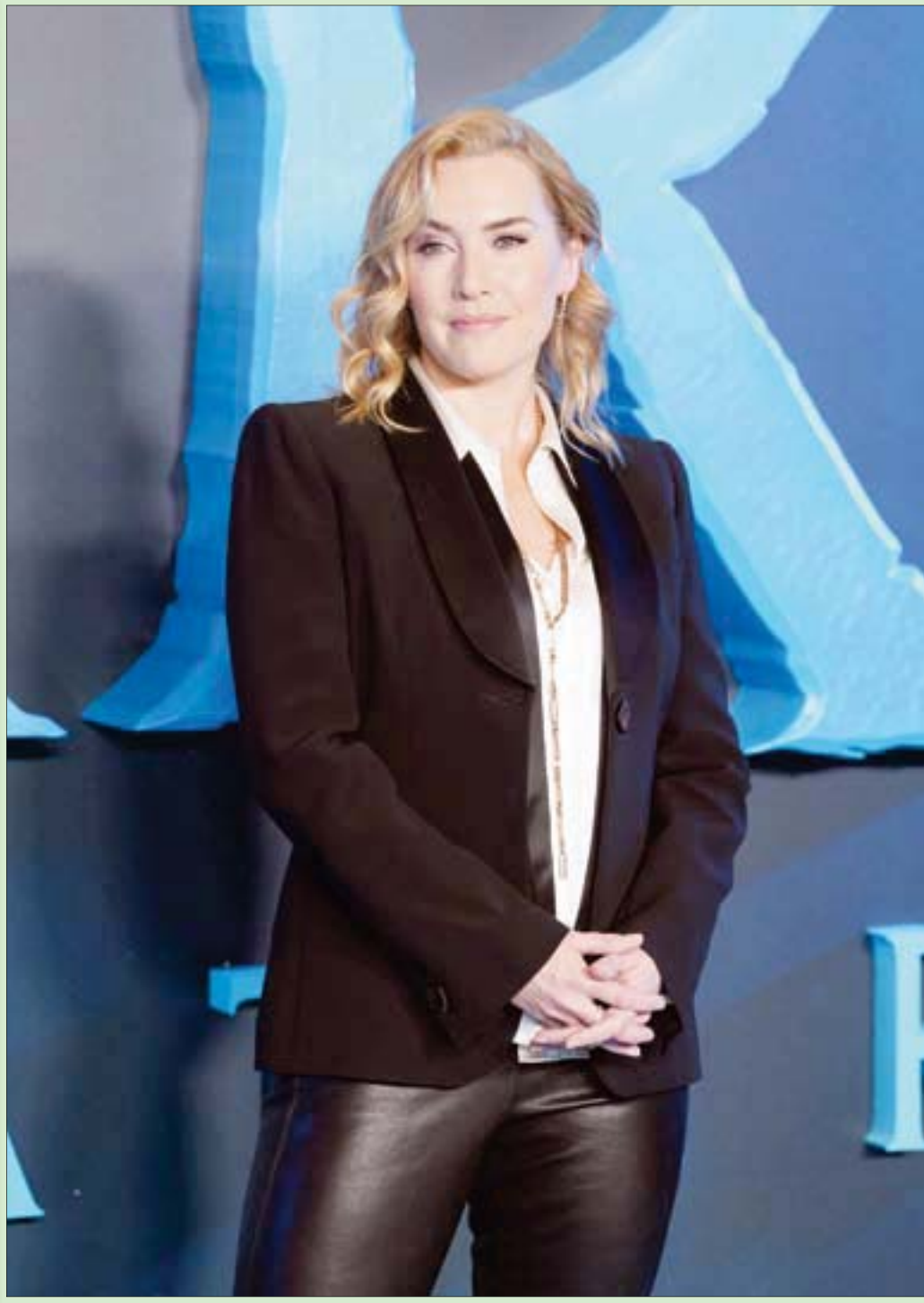
المثلة الإنجليزية كيت وينسليت تقف أمام المصورين للترويج لفيلم «الرمزية: طريق المياه» في وسط لندن أمس

أما مسألة «القيم»، ومن يعرفها ويضع حدودها و«يرابط» على ثغورها، ويصون جنابها، فتلك مسألة تتجاوز إيران للعالم العربي والإسلامي. إن أخذنا ما يخشى منه، هو تسلسل قلوب الإسلاميين المسبيين، من شبك القيم، بعدما طردوا من باب السياسة؛ وذاك حديث آخر يستحق فرصة تالية.