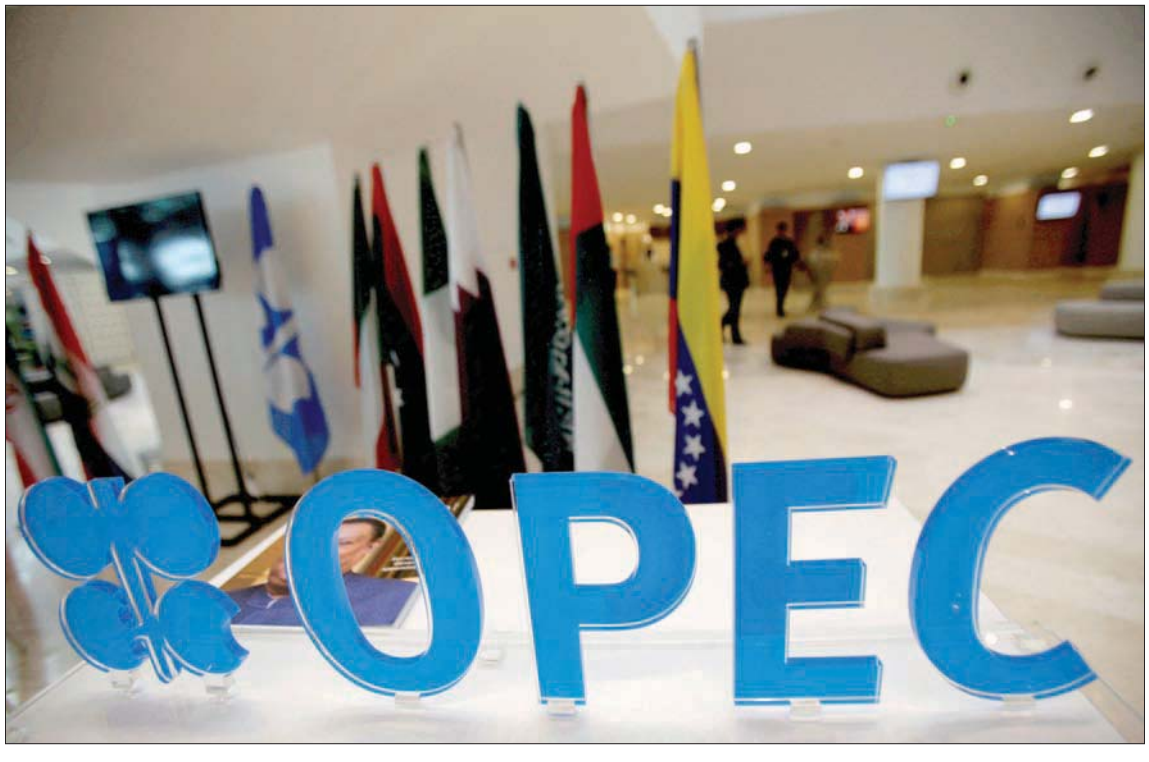
شعار «أوبك بلس» على باب المنظمة بمقرها الرئيسي في فيينا وخلفه أعلام الدول الأعضاء.