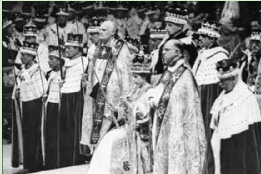
من تتويج ملكة بريطانيا إليزابيث الثانية عام 1953

الوسيط، والذي قد أذيب في عام 1649. ويعتقد أن التاج الأصلي يعود إلى القديس الملكي «إدوارد الاعترف» من القرن الحادي عشر، وهو آخر ملوك إنجلترا من الأنجلو-ساكسون. ويذكر أن تاج «سانت إدوارد» هو الذي يظهر في شعار الدولة الملكي للمملكة المتحدة، وشعار البريد الملكي، وشارات القوات المسلحة. وجاء في بيان قصر باكنغهام الصادر أول من أمس: «أزيل تاج القديس إدوارد، القطعة الرئيسية التاريخية من جواهر التاج الملكية، من برج لندن للسماح بالتعديل. مع بدء العمل عليه قبل حفل التتويج يوم السبت 6 مايو (أيار) لعام 2023.