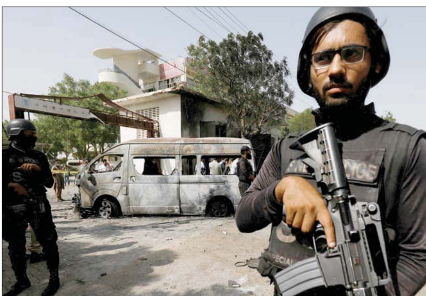
عناصر أمن أمام جامعة كراتشي بعد انفجار في أبريل الماضي

وبعكس ما كانت عليه الأوضاع قبل عام 2014، تاريخ عملية الجيش الباكستاني لتطهير المنطقة من عناصر «طالبان الباكستانية»، لا توجد الآن أي منطقة أو إقليم تحت السيطرة المباشرة للحركة. ويقول الخبراء إنه في مثل هذه الظروف،