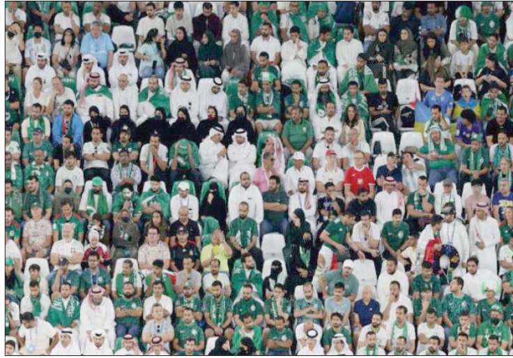
الجمهور السعودي في كأس العالم