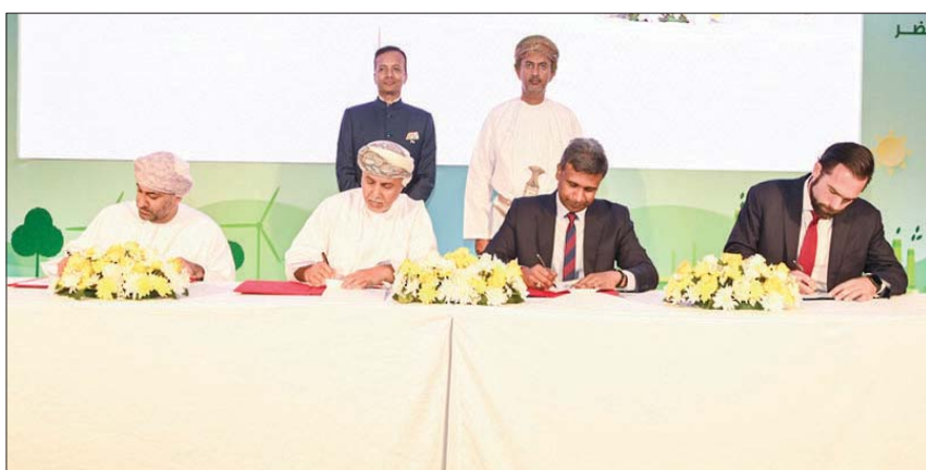
مراسم توقيع اتفاقية إقامة مصنع إنتاج الحديد الأخضر بالدمق في سلطنة عمان بـ3 مليارات دولار (العمانية)

إنتاج الطاقة المتجددة من خلال طاقة الرياح والطاقة الشمسية التي سيضطر جزء منها، والباقي للاستخدام المحلي. وقال في تصريح صحفيين: «إن مشروع جنبدال شديد لإنتاج الحديد الأخضر يُعد أول مشروع كبير يُتوقع أن ينتج خمسة ملايين