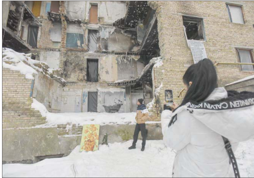
أوكرانيان يلتقطان صورة أمام بناية مدمرة بفعل الحرب قرب كييف