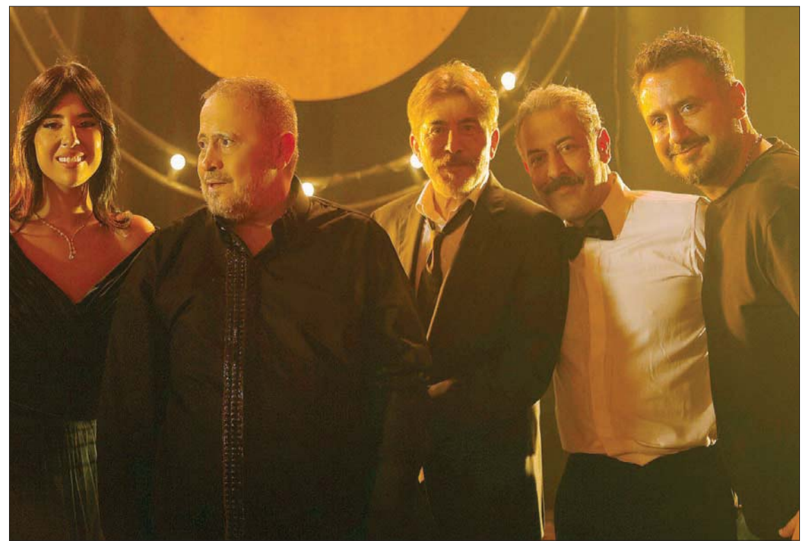
جورج وسوف يتوسط المخرج وأبطال العمل

يتحدث عن السينما بحماس، ولكن عينه على الفن الآخر. «بالنسبة لي المسرح هو هدفي الأكبر، لا سيما في ظل هذه الظروف، ولكن نصحني لم أعمل جديد، ولكن نصه لم يكتل بعد. وليست مستعجلاً، لأنني أفضل الثاني وليس من الضرورة أن يعرض هذا العمل في موسم رمضان. فالأهم أن يتم تنفيذه على المستوى المطلوب».