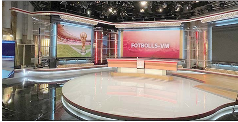
استوديو نقل تلفزيوني