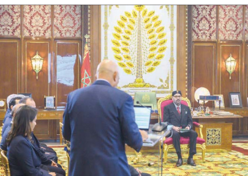
الملك محمد السادس لدى ترؤسه مراسم تقديم البرنامج الاستثماري الأخضر «الجديد» للجمع الشريف للفوسفات (ماب)

تزيد جميع منشآت الصناعة بالطاقة الخضراء بحلول سنة 2027. وستمكن هذه الطاقة الخالية من الكربون من تزويد المنشآت الجديدة بالألزام لتحلية مياه البحر، من أجل تلبية احتياجات المجموعة، وكذا تزويد المناطق المجاورة لواقع «الجمع الشريف للفوسفات» بالماء الصالح للشرب والري. كما سيتمكن هذه الاستثمارات، على المدى البعيد، من وضع حد لاعتماد «المجموعة»، التي تعدّ المستورد الأول للأمونياك على الصعيد العالمي، على هذه الواردات، وذلك عبر الاستثمار في سلسلة الطاقة المتجددة (الهيدروجين الأخضر - الأمونياك الأخضر)، مما سيمكنها من ولوج سوق الأسمدة الخضراء بقوة وحلول