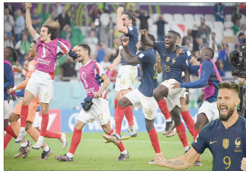
فرحة فرنسية بعد بلوغ مرحلة دور الثمانية في المونديال

عام 1962. وأطلق أوريليان تشواميني كرة قوية من خارج المنطقة أبعدها الحارس البولندي فويتشخ شتشييزني في الدقيقة 11. وقام عثمان ديمبيلييه بمجهود فردي وراوغ أكثر من مدافع بولندي قبل أن يطلق كرة زاحفة، ارتدى عليها الحارس البولندي بسهولة في الدقيقة 17.