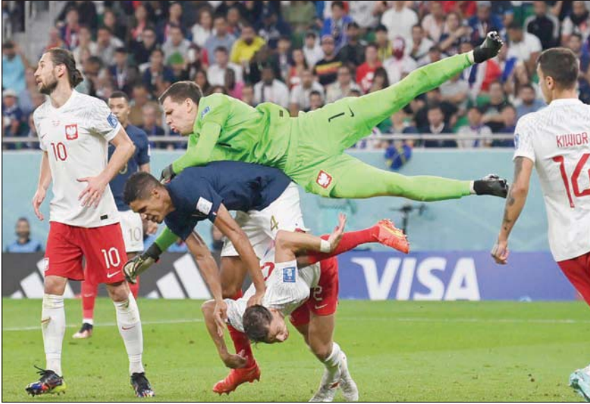
شتشييزني حارس بولندا يتصدى للكرة قبل وصولها للفرنسي فاران

المباراة هي الثانية بين المنتخبين في النهائيات، كانت الأولى على المركزين الثالث والرابع في نسخة عام 1982 وانتهت بفوز بولندا 3 - 2.