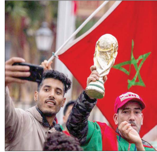
فرحة جمهور المنتخب المغربي