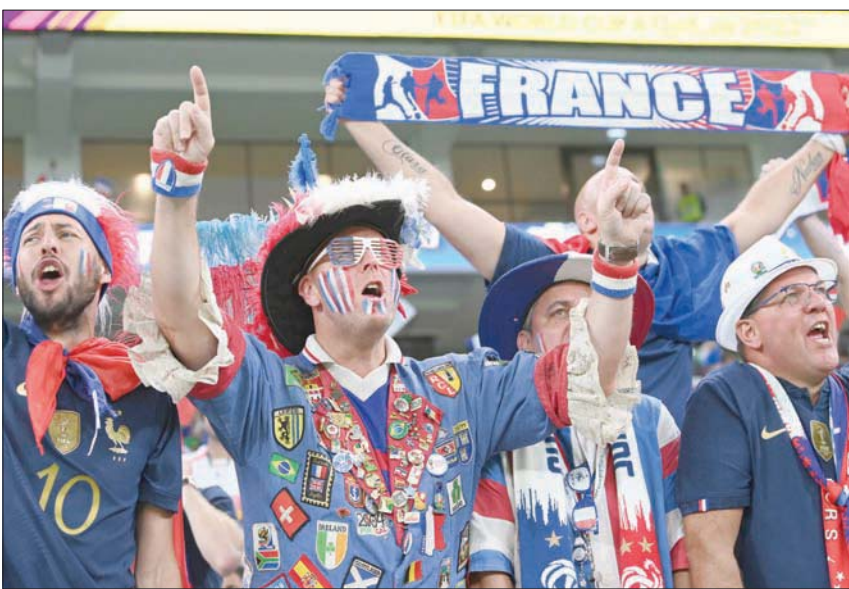
مشجعون فرنسيون يساندون منتخب بلادهم في المباراة