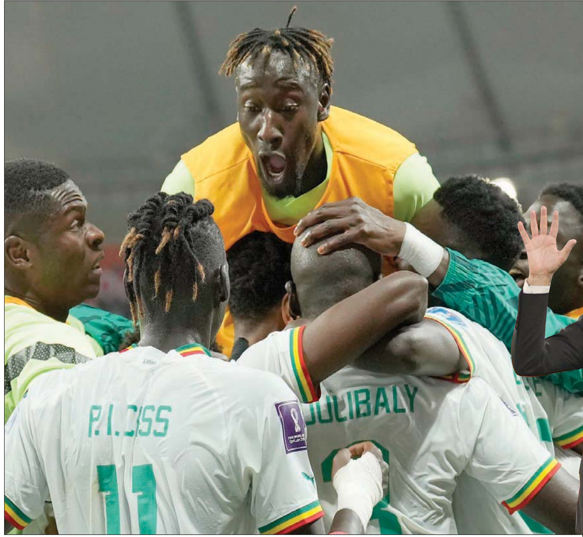
السنغال أثبتت جدارتها بالوصول لثمن النهائي حتى من دون نجمها الأفضل ساديو ماني

مقدمة في كأس العالم عندما يخصص لها خمسة مقاعد فقط في المونديوال. إذا كان لديك 12 أو 14 مقعدا، فإن احتمال تحقيق أحد المنتخبات الأفريقية لتقدم في البطولة سيكون أكبر بكثير». وبالنسبة للفرق الأفريقية، ربما يعد هذا هو التحول الأكبر في كرة القدم الأفريقية خلال نصف العقد الماضي. وقال أوتو أدو، المدير الفني لمنتخب غانا الذي استقال من منصبه بعد الخروج من كأس العالم، بعد هزيمة غانا في المباراة الافتتاحية أمام البرتغال: «من الصعب للغاية أن تصل المنتخبات الأفريقية إلى أدوار