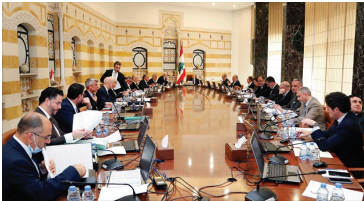
الحكومة اللبنانية في آخر جلسة عقدت برئاسة عون (اليمين)

«التيار» و«القوات» يعارضانها... والراعي يدعو إلى «تصويب الأمور»