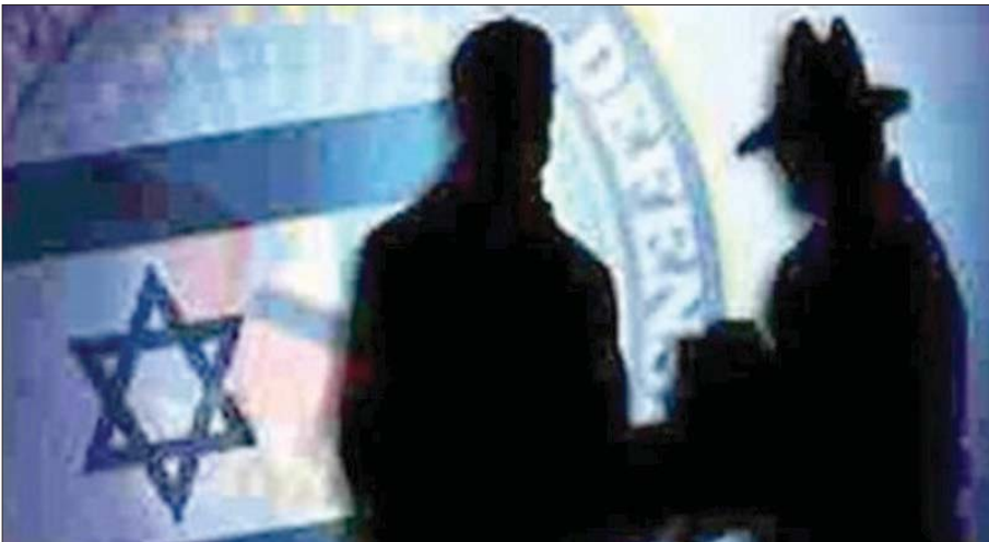
صورة نشرتها «تسنيم» مع تصريحات المسؤول الأمني الإيراني عن الموساد