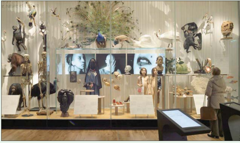
المجموعات مفتوحة لأي شخص يأتي بمشروع بحثي قوي وجاد (نيويورك تايمز)

باريس، كونستان ميو» يقول نقاد إن «متحف الإنسان» يحجب معلومات عن مجموعته الضخمة من الرفات البشرية التي يمكن أن تساعد المستعمرات السابقة وأحفاد الشعوب التي احتلت في استعادة الرفات. يعد «متحف الإنسان» واحداً من المعالم البارزة في باريس، وبواجهته الضخمة التي تنتمي لطرانز «أرت ديكو». ويغد على المتحف سنوياً مئات الآلاف لمعاينة هياكل عظمية وتماثيل صغيرة تعود إلى عصور ما قبل التاريخ. تعود رفات الأميركيين الأصليين، وفي العديد من القضايا البارزة التي ظهرت الفترة الأخيرة، أعادت متاحف في هذه البلدان جماجم ورؤوساً محنطة، مع وعد بإقرار مزيد من الثقافية والمسألة. في الولايات المتحدة، أقر قانون فيدرالي عام 1990 يسر عودة رفات الأميركيين الأصليين، رغم أن عمليات الاسترداد سارت بوتيرة بطيئة. ودار نقاش حول الأمر بين عدد من الجامعات والمتاحف البارزة، بما في ذلك متحف الآثار والأنثروبولوجيا التابع لجامعة بنسلفانيا ومؤسسة سميثسونيان، وفي بعض الحالات جرت صياغة سياسات لكيفية التعامل مع رفات العبيد المحترجة في المجموعات التابعة لهذه الكيانات.