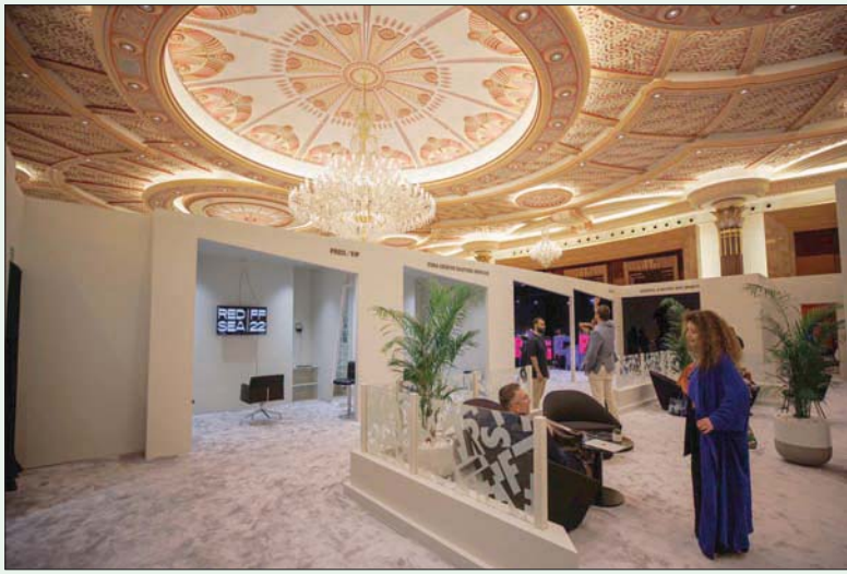
زائرون يعيشون تجربة السينما الافتراضية