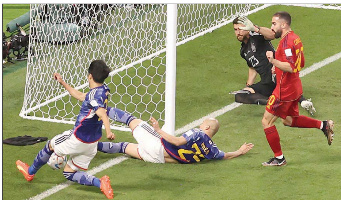
الكرة التي سجل منها منتخب اليابان هدف الفوز على إسبانيا وأثارت جدلاً حُسم عن طريق «الحكم الآلي»

ال18 التي أشهرها الحكام في دور المجموعات في عام 2006، والبطاقات الحمراء الـ13 في عام 2002.