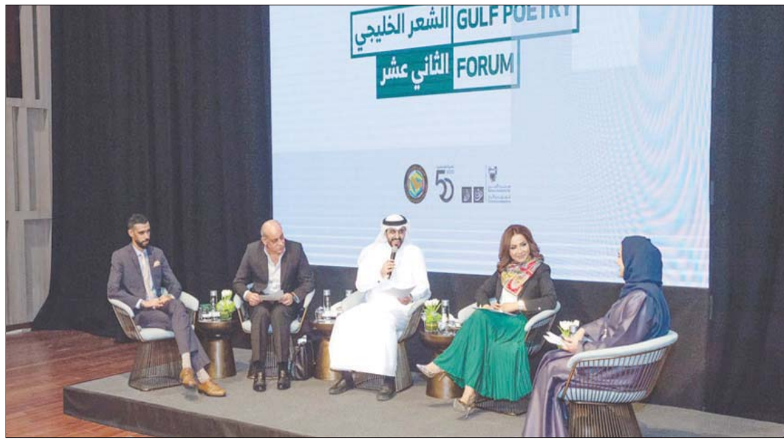
من إحدى جلسات منتدى الشعر الخليجي

غيرت عدد التفعيلات في أسطر القصيدة. هنا يستعاد البيت الشعري في مجمل الأعمال، ومع البحر الشعري الواحد (وإن نوع البعض في البحور في القصيدة الواحدة). غير أن هذه الاستعادة هيمنة قصيدة التفعيلة بعد أن تربع الشكل التفعيلي على عرش القصيدة طوال السبعينات والثمانينات من ذلك القرن على وجه التقريب. برزت قصيدة النثر لعدة أسباب، كان من أهمها سعي الشعراء لتجديد لغة القصيدة وبنيتها بعد أن بدأ أن اللغة الشعرية انتهكتها عقود من الاستعمال، وصار من الصعب اجتراح جديد في تلك اللغة أو الإبتنية. ذلك السبب نفسه كان وراء