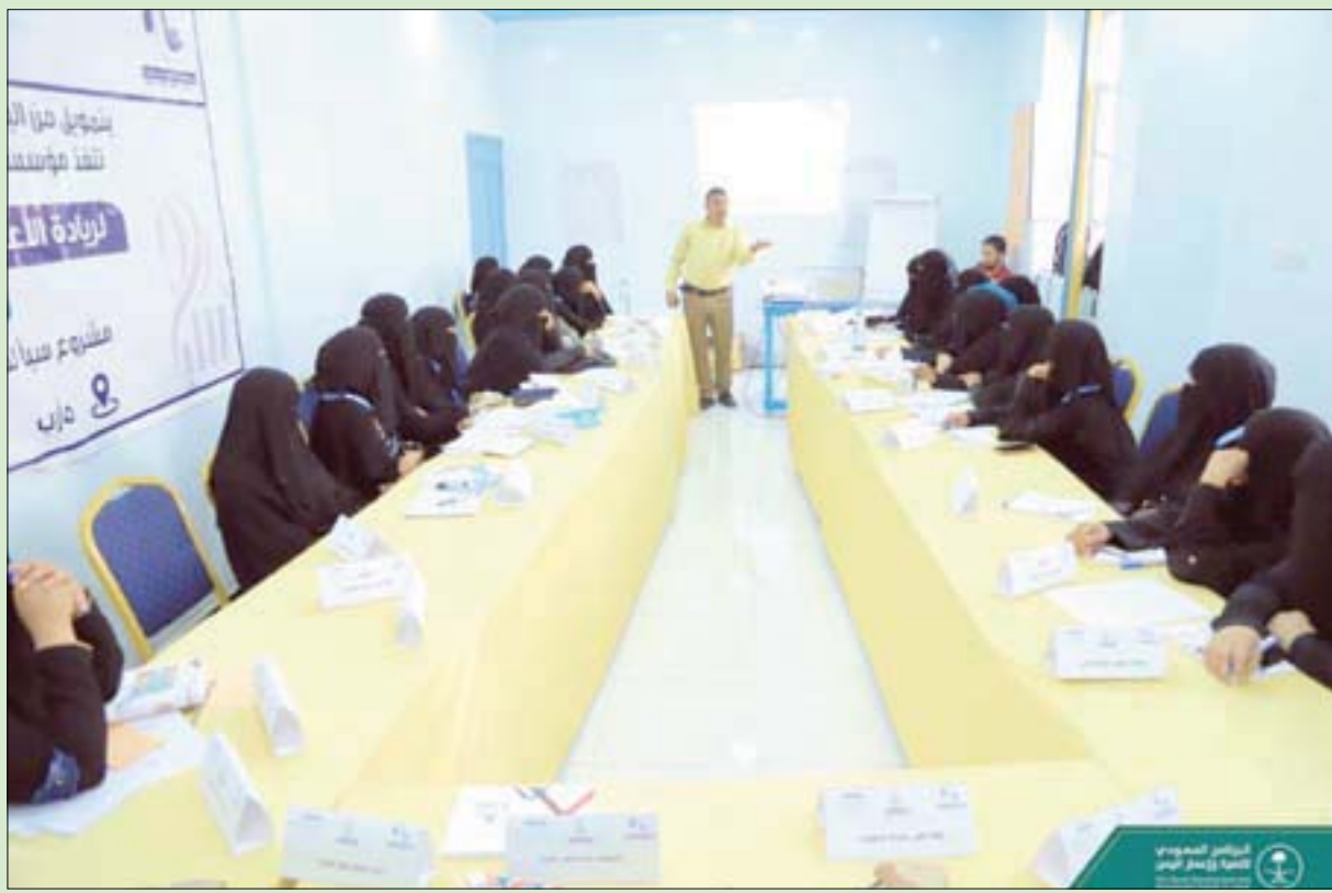
يمنيات في مأرب يتدربن على قيادة الأعمال بتمويل سعودي