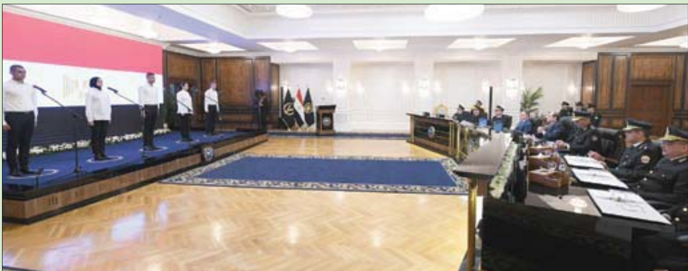
الرئيس المصري خلال زيارته لأكاديمية الشرطة

لاختبارات أكاديمية الشرطة، بضرورة التسلح بالعلم والمعرفة ومواصلة الإطلاع بانتظام، حتى «يشكلوا حائط صد منيع»، بجانب زملائهم في الكليات والمعاهد العسكرية، والجامعات والمعاهد المدنية الأخرى، ضد «كافة التحديات التي تشهدها الدولة المصرية».