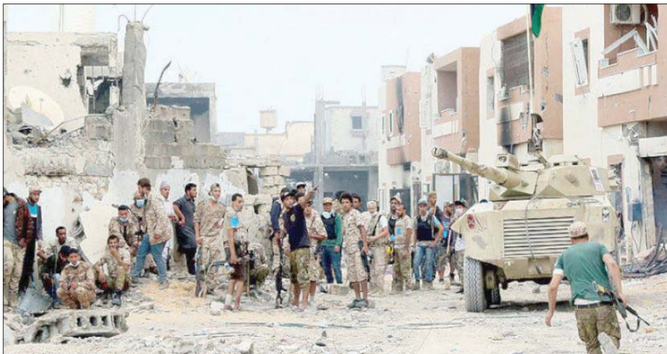
قوات ليبية تهاجم مواقع «داعش» خلال عملية «البيان المرصوص» في مدينة سرت 2016