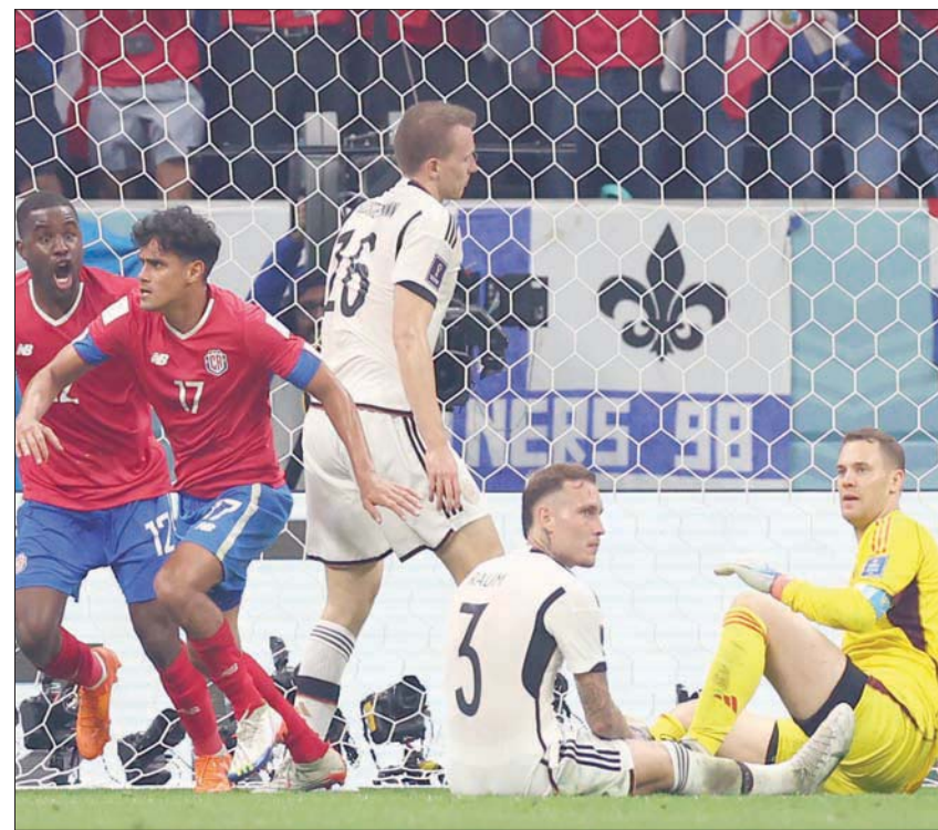
علامات استفهام كثيرة لاحقت أداء المنتخب الألماني في كأس العالم 2022

الأسوأ أن هذا الفشل هو مجرد عرض لمرض طويل الأمد في كرة القدم الألمانية، وعدم القدرة على إنتاج لاعبين بالجودة والتنوع الذي تتطلبه المنافسة على الساحة العالمية. وأشار فليك إلى هذا الأمر عندما قال إن إسبانيا وإنجلترا تتقدمان على ألمانيا بسنوات فيما يتعلق بتطوير اللاعبين الشباب. واتفق أوليفر بيرهوف، مدير الاتحاد الألماني لكرة القدم والذي قد يكون أول ضحية لهذه الكارثة، مع هذا الرأي، قائلاً: «المشكلات التي