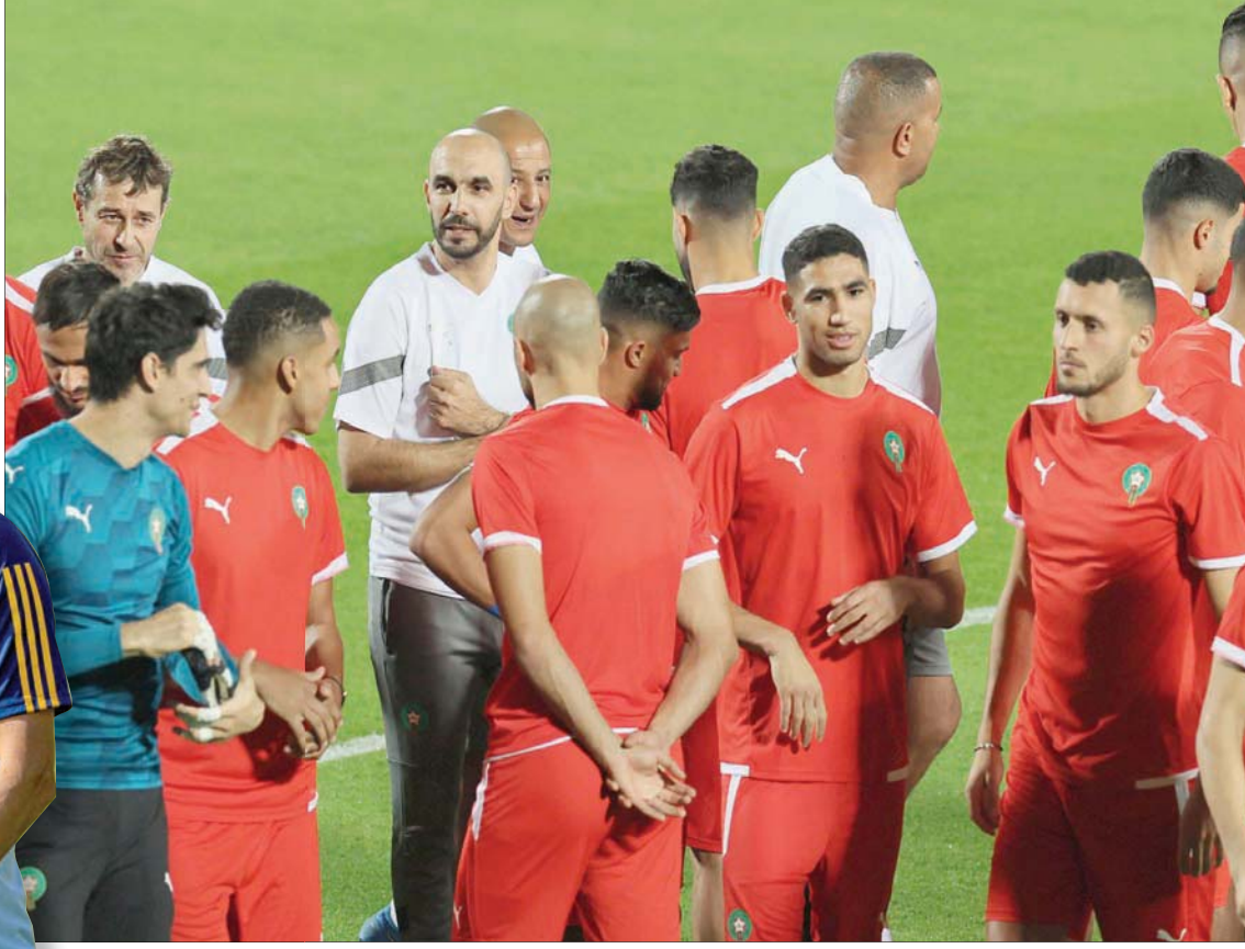
الركراكي خلال إشرافه على تدريبات المغرب استعدادا لمواجهة إسبانيا

وقال رودري: «دوري في الفريق هو نفسه مثل أي قلب دفاع، وهو الخروج من الخلف لإعطاء الاتساق والصلابة للفريق. كل لاعب له دور واضح. أحاول استغلال مميزات. أساعد في الخروج بالكرة من الخلف. يمنحنا منافسونا مساحة قليلة بين الخطوط لذلك فإن قلب الدفاع مهم جدا في طريقنا. لدينا طريقة محددة للعب، بدءا من الخلف... طريقنا في اللعب هي تقديم الحلول وإخراج الكرة من الخلف، لكننا ندرك متى نتعين علينا المخاطرة ومختصر لا تفعل ذلك».