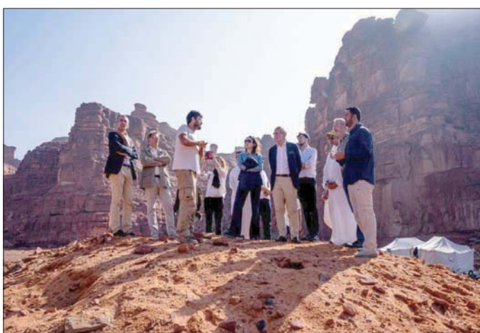
الإنجازات السعودية - الفرنسية في التعاون الثقافي وصلت إلى أفاق جديدة

يعود للفترة اللبنانية، الذي يبرز ما لدى السعودية عمومًا ومحافظة العلا بالتحديد، من إرث تاريخي وحضاري، في وقت تستمر أعمال البعثات الأثرية وفقاً لإستراتيجية التي وضعت لحكم حضارة لحيان لعدة قرون، ولا تزال على إيمان المواقع الأثرية والحضارات الإنسانية، والتعاون مع أبرز الخبرات حول العالم.