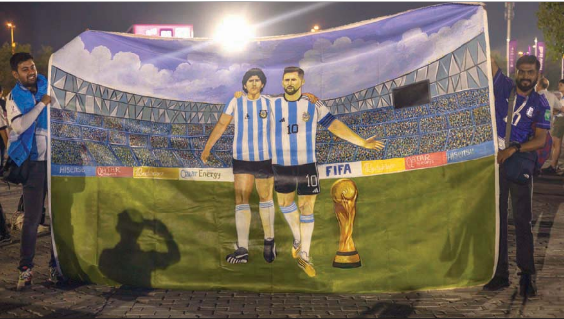
ميسي ومارادونا أسطورة الأرجنتين

واكد ميسي (35 عاماً) الذي من المرجح أن يخوض موندياله الأخير، أن مارادونا سيكون سعيماً جداً» غداة تحطيم الأول الرقم القياسي لعدد المشاركات بكأس العالم (22) في مباراة الفون على بولندا بهدفين نظيفين، وقال: «لم أكن أعلم بذلك إلا بعد المباراة... من الرائع أن أكون