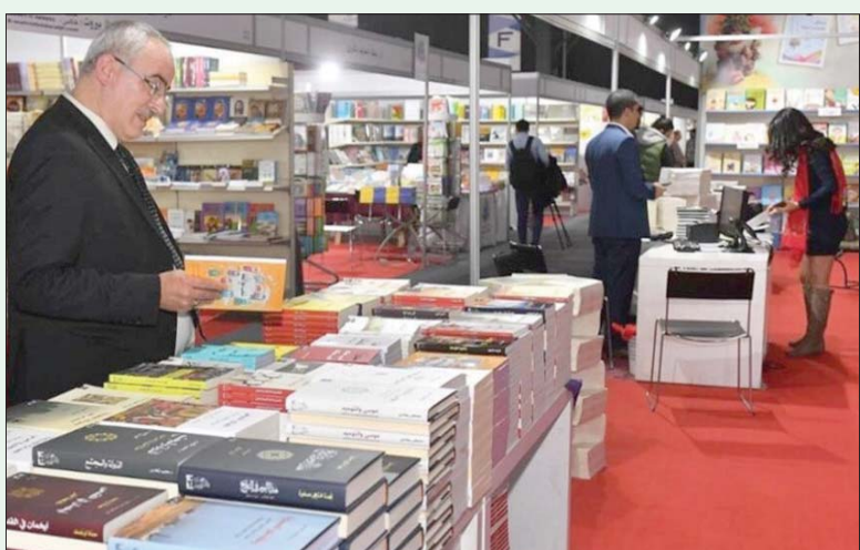
معرض بيروت للكتاب في دورة سابقة

ويتراقف المعرض الذي يحمل عنوان «أنا أقرأ بتوقيت بيروت» مع برنامج ثقافي يضم عشرات الأنشطة بين ندوة وحوار ومحاضرة، وهناك طلبات للمشاركة، قدمت بعد طبع البرنامج. وسيتمكن الراغبون من إقامة أنشطتهم في الصالة الوحيدة المتوفرة التي باتت أنشطتها تبدأ من الثالثة بعد الظهر وتستمر حتى المساء.