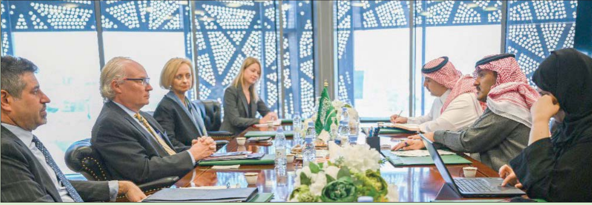
آل جابر وليندركينغ خلال لقائهما في الرياض الجمعة

ومع تعثر المساعي الأممية والدولية في إقناع المليشيات الحوثية بتجديد الهدنة وتوسعتها، واستمرار الجماعة المدعومة من إيران في تهديد موانئ تصدير النفط، كانت الحكومة اليمنية قد سحرت على رفع الجاهزية الأمنية والعسكرية، ودعت إلى الإسناد الشعبي، ملحوة باللجوء إلى ما وصفته بـ«الخيارات الصعبة» رداً على الإرهاب الحوثي.