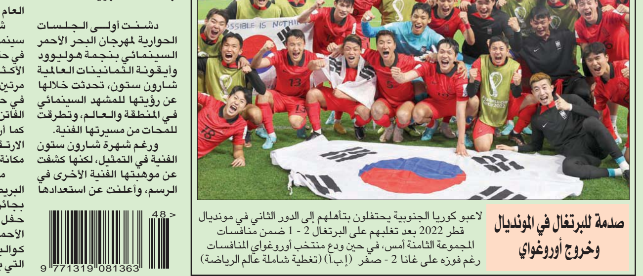
صدمه للبرتغال في المونديال وخروج أوروغواي

الآن حقاً أن تكيف تدابير الرقابة التي تحتاجها مع حياة الناس ومصادر عيشهم وحقوقهم». وأضاف، حسب وكالة الصحافة الفرنسية: «تريد بالفعل أن نرى هذا التحسن يتحقق ويتسارع». وبدأت عدة مدن تخفف من القيود، بحيث تخلت بعضها عن إلزامية إجراء فحوص «كوفيد-19» يومية بكثافة. وحول لقاء جمع رئيس مجلس الاتحاد الأوروبي شارل ميشال والرئيس الصيني شي