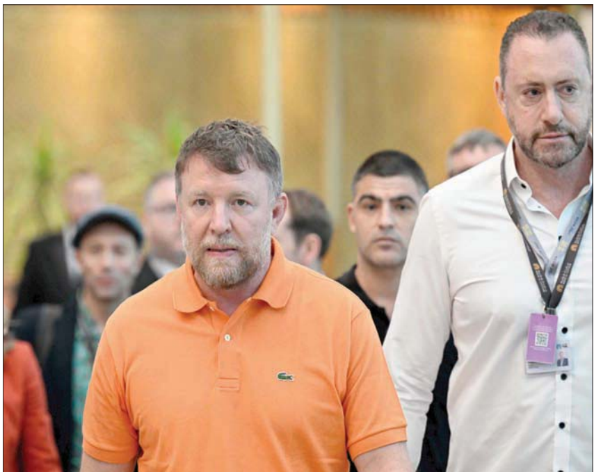
المخرج البريطاني غاي ريتشي