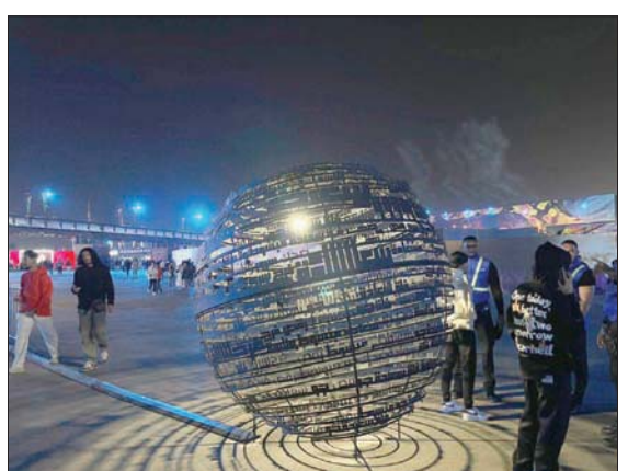
«كرة البهجة»... من الأعمال الفنية الموزعة في أرجاء المكان