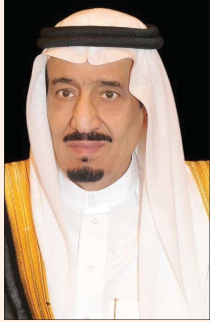
الرياض، الشرق الأوسط

هنا خادم الحرمين الشريفين الملك سلمان بن عبد العزيز، والأمير محمد بن سلمان بن عبد العزيز ولي العهد رئيس مجلس الوزراء السعودي، في برقيتين، الرئيس الإماراتي الشيخ محمد بن زايد آل نهيان، بذكرى اليوم الوطني لبلاده.