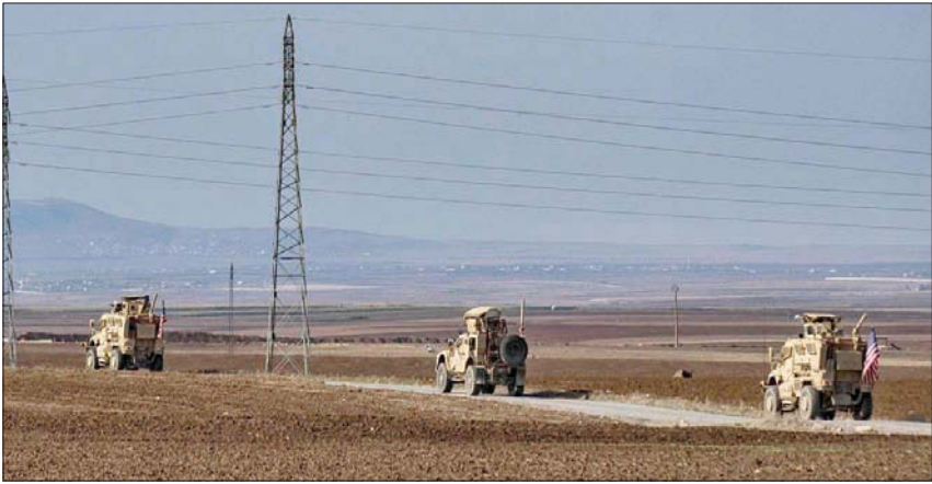
دورية عسكرية أميركية في الحسكة قرب الحدود التركية أمس

وأعادت تركيا التأكيد على تمسكها بالعملية العسكرية في شمال سوريا. وشدد مجلس الأمن القومي التركي على أن أنقرة ستستخذ الخطوات اللازمة لعدم السماح بوجود نشاط لأي تنظيم