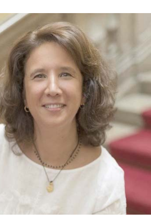
ريتا ماركيز وزيرة البرتغال للسياحة

وأضافت: «بطبيعة الحال، كنا بحاجة أيضاً إلى معالجة المشكلات ومواجهة التحديات من خلال السياسات