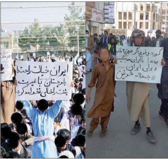
محتجون يرفعون شعارات متضامنة مع الأكراد في بلوشستان جنوب شرق إيران (تويتر)

وتستهدف أحدث جولة من العقوبات أربعة أفراد وخمسة كيانات قالت أوتوا أنها مرتبطة بـ «بانتهاكات طهران الممنجة لحقوق الإنسان» والإجراءات التي «تهدد السلم والأمن الدوليين». ونقلت رويترز عن البيان «كندا لن تقف مكتوفة الأيدي بينما تتزايد انتهاكات النظام لحقوق الإنسان في نطاقها وشدتها ضد الشعب الإيراني».