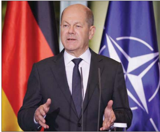
المستشار الألماني أجرى المكالمات الهاتفية مع بوتين بمبادرة من جانبه (إب.أ)

واشنطن، هبة القدس موسكو - برلين، الشرق الأوسط،