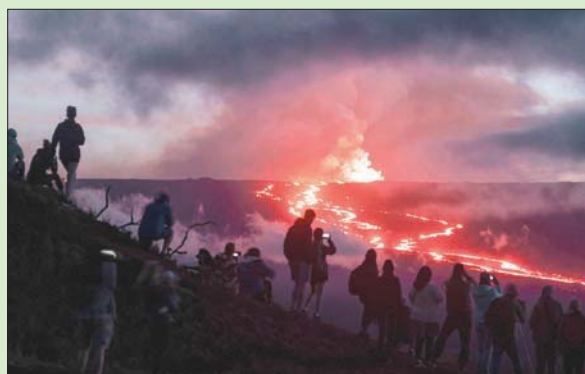
يتوافد العشرات لشاهدة تدفق الحمم من بركان ماونا لوا

توجد مؤشرات على أن الحمم البركانية ستهدد المناطق المأهولة بالسكان، بدأ العشرات يتوافدون يومياً، بما في ذلك العائلات التي لديها أطفال في ملابس النوم، بالقرب من القمة. وبعد وصولهم سيحبون مقاعد أكياس تخييم من سياراتهم ويستقرون فيها ويشاهدون أعجوبة الطبيعة يتدفق المتفرجون لإلقاء نظرة على الحمم المتدفقة من بركان ماونا لوا في هاواي، أكبر بركان نشط في العالم، الذي بدأ ثورانه هذا الأسبوع لأول مرة منذ عام 1984. وبعد إعلان وكالة إدارة الطوارئ في هاواي أنه لا