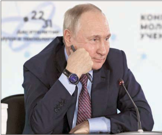
نند الرئيس الروسي فلاديمير بوتين الجمعة بالسياسات الغربية «الدمرة» والداعمة لكيف