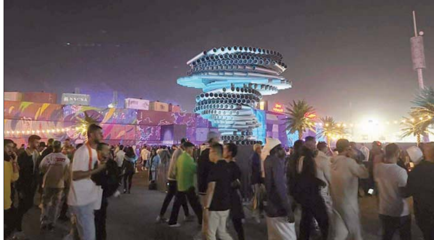
أعد الأعمال الفنية