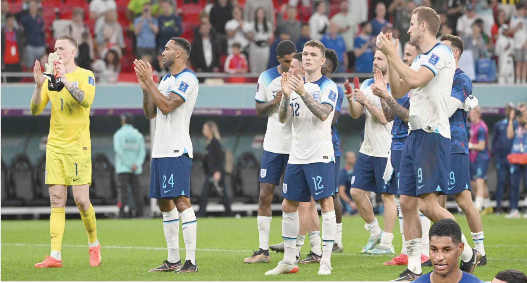
لاعبو المنتخب الإنجليزي وفرحة تخفي ويلز والتأمل لدور الـ16

العكس من ذلك فهناك مشاعر تفاؤل قبل مباراة فريق ساوثغيت أمام السنغال في دور الـ16 غداً. ولم ينجح كين، الذي سجل 51 هدفاً مع إنجلترا ويتأخر بهدفين فقط عن واين رونسي الهدف فقط على تحقيق الفوز، في هز الشباك بعيداً أو ليونيل ميسي بل شك هذا المنافسين تقريباً في أول ثلاث جولات.