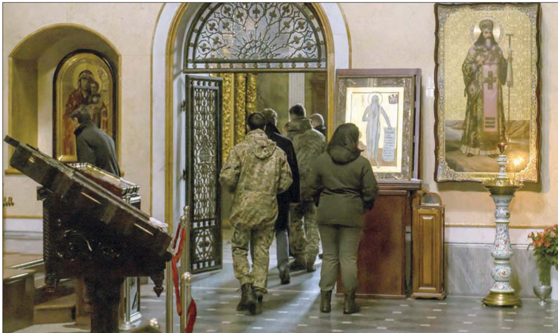
باشر جهاز الأمن الأوكراني، بدء تحقيقات في مرافق تابعة للكنيسة الأرثوذكسية في العاصمة كيف (رويترز)

الرئيس الأوكراني السابق بيثرو بوروشينكو. ووصف الحدث في حديثه بأنه «تاريخي». كان البطريرك برثلماوس ومقره إسطنبول قد أعلن قبل ذلك، في أكتوبر (تشرين الأول) 2018 القرار التاريخي بالاعتراف بكنيسة أرثوذكسية مستقلة في أوكرانيا، ما أثار غضب الكنيسة الروسية. وبرغم أن الخطوة كانت متوقعة، بعدما أعلنت الكنيسة الأوكرانية في مجمع كنسها قبل شهرين من ذلك، انفصالها نهائياً عما وصفته بـ«هيمنة الميلاد وفقاً للتقويم الشرقي 7 يناير (كانون الثاني) ما أثار غضباً إضافياً في روسيا. موسكو رأت أن الوثيقة تعد «انتهاكاً لكل القوانين الكنسية وهي بالتالي لا تتمتع بأي قوة قانونية». بينما أكد القس الكسندر فولكوف الناطق باسم بطريركية موسكو وسائر روسيا، أن البطريرك برثلماوس «انسحل بنفسه نهائياً عن الأرثوذكسية العالمية ووقع في الشقاق». في حين حذر رئيس قسم العلاقات الكنسية الخارجية في البطريركية المطران إيريلاريون من «تداعيات تكريس شقاق الأرثوذكسية».