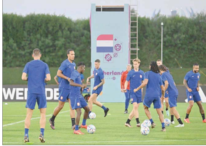
لاعبو هولندا خلال التدريب لخوض ثمن النهائي والاقتراب من تحقيق الحلم الغائب

بثلاثية نظيفة. ومن المرجح أن يستعين فان غال بنجمه المخضرم ممفيس ديباي أمام المنتخب الأميركي في القائمة الأساسية، لا سيما بعد أن أثبت تعافيه تماماً من إصابة عضلية خلال اللقاء الأخير بدور المجموعات أمام قطر، حيث أسهم في هدفي فوز فريقه. وأشار فان غال إلى أنه كان يعمل على إفساد ديباي إلى اللعب بشكل تدريجي، لأن مهاجم برشلونة الإسباني لم يخض أي لقاء رسمي قوي منذ نحو شهرين، وقال: «لقد شكل فاركا كبيراً عندما ظهر أمام قطر بقوة المعتادة، ولعب دوراً مهماً في منحنا النقاط الثلاث».