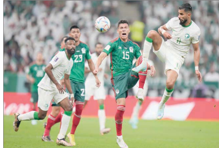
مباراة المكسيك الأخيرة شهدت تغييراً مفاجئاً في طريقة وأسلوب الأخضر