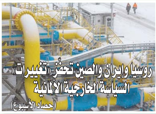
روسيا وإيران والصين تجمعاً (تغييرات) السياسة الخارجية الألمانية (حصار الأوساط)