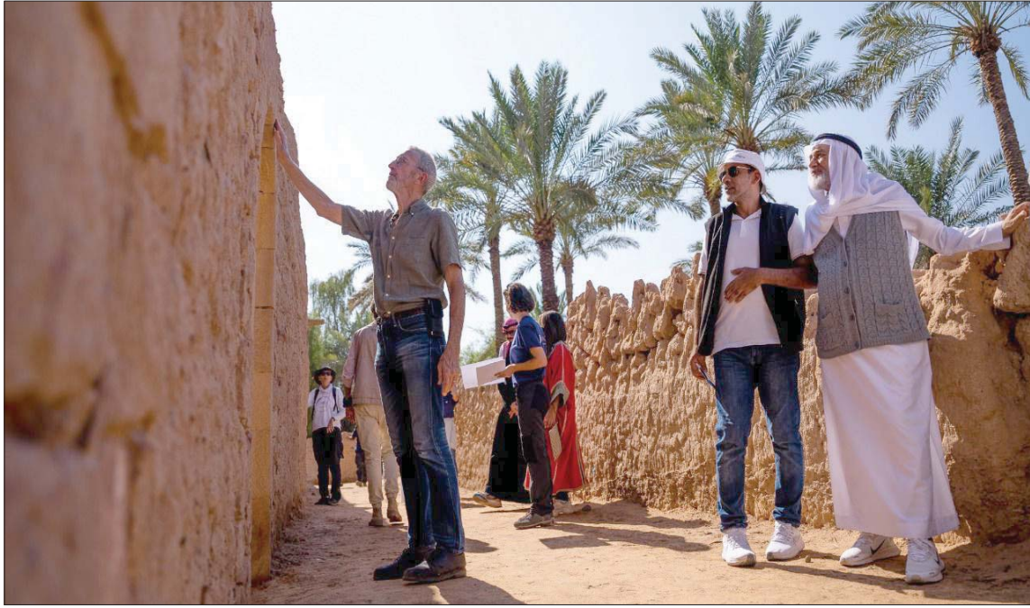
وقعت الهيئة الملكية لمحافظة العلا اتفاقية مع متحف «الوفر» في باريس