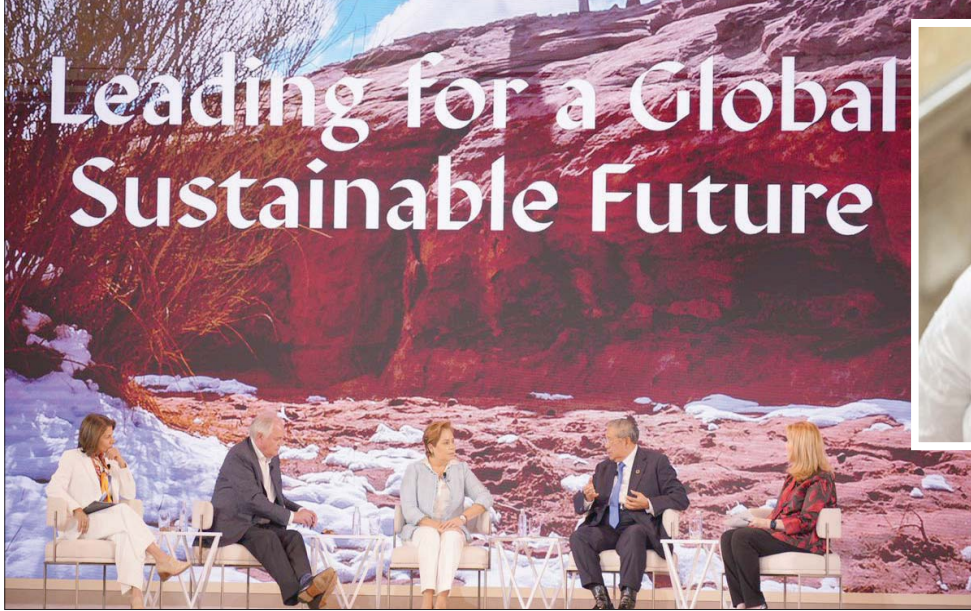
حضور وزاري ضخم لقادة القطاع السياحي العالمي خلال قمة السفر والسياحة المنتهية في الرياض (الشرق الأوسط)

ومع ذلك وفق ماركيز، فإن روسيا أكثر انكشافاً على الاتحاد الأوروبي، حيث يُعزى 7,4 في المائة من إجمالي القيمة المضافة الروسية إلى المدخلات المباشرة القادمة من الاتحاد الأوروبي، بينما يمتص الطلب النهائي للاتحاد الأوروبي 9,4 في المائة من إجمالي الإنتاج الروسي، مؤكداً أنه لا توجد منطقة أخرى مهمة بالنسبة لروسيا مثل الاتحاد الأوروبي، إذ تأتي الصين في المرتبة الثانية، واستطردت: «الصناعة الروسية تشكل بالنسبة مدخلات الاتحاد