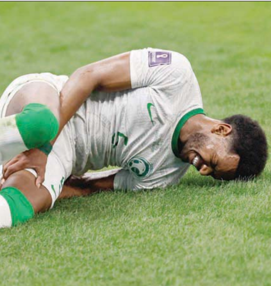
إصابة البليهي بعثرت أوراق رينارد أمام المكسيك

ولفت العبدلي إلى مشاركة عدد من لاعبي الأخضر في