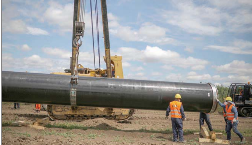
خط أنبوب الغاز الروسي التركي الذي يمر في بلغاريا... اقترحت موسكو أخيراً إقامة مركز توزيع للغاز الروسي في تركيا

تقديم تعويضات عن الأضرار السابقة التي يزعم أنها ناجمة عن الوقود الأحفوري. ويقول ريتز، إن رد فعل إدارة بايدن فيما يتعلق بالطاقة إزاء سفك الدماء في أوكرانيا، يتمثل في تجاهل القضية، فليس هناك حديث عن استخدام الطاقة في أي مكان في الإدارة الأميركية. والجماعات الموالية لأوكرانيا التي تود إشارة هذه القضية، لن تفعل ذلك خوفاً من أي رد فعل سياسي داخلي أميركي. وبينما تمول روسيا حربها في أوكرانيا بإنتاج وبيع كميات كبيرة من النفط والغاز، والفحم؛ تلغي إدارة بايدن خطوط الأنابيب، وتحد من العقود الجديدة، وتستخدم لوائح وزارة الداخلية ووكالة حماية البيئة المبالغ فيها لزيادة التكاليف وتقييد إمدادات النفط والغاز. وتستخدم القواعد الاجتماعية البيئية لوقف الاستثمارات في البنية الأساسية للنفط والغاز.