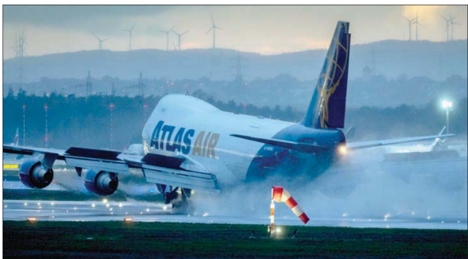
طائرة تهبط في المطار الدولي مع توربينات رياح في الخلفية في فرانكفورت، ألمانيا