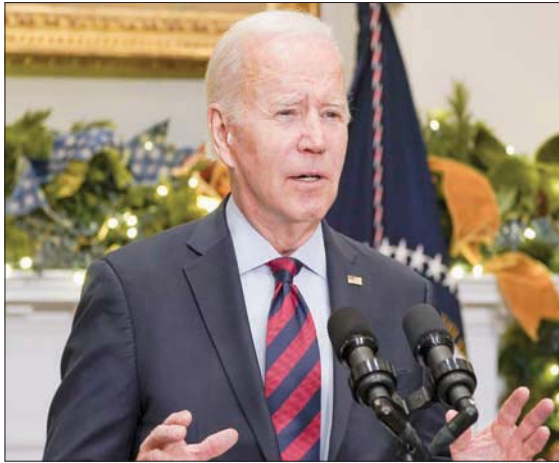
جو بايدن أبدى استعداده للدخول في مفاوضات بشأن أوكرانيا مع بوتين