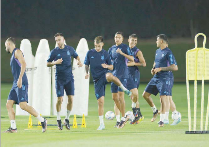
منتخب الأرجنتين يستعد لخوض معركة جديدة أمام منافس أسويي

وقال سكالوني: «جميع المنتخبات المشاركة في النهائيات صعبة. لقد رأينا ذلك ضد السعودية. إذا كنتم