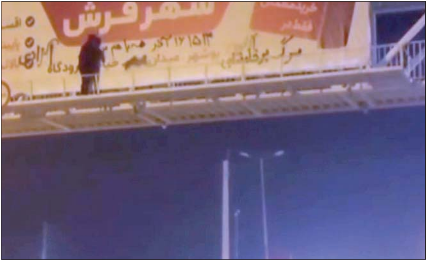
محتج إيراني يكتب شعارات منددة بخامنئي فوق ملصق دعائي في طريق سريع وسط طهران

في إيران، ومقرها أوسلو، بأن قوات الأمن قتلت حتى الآن 448 متظاهراً على الأقل، معظمهم في بلوشستان. وعلق مدير المنظمة محمود اميري مقدم، على المظاهرة النسائية الأخيرة في زاهدان بالقول، «إنها بالفعل نادرة من نوعها»، إذ إن المدينة شهدت على مدى الشهرين الماضيين خروج الرجال إلى الشوارع بعد صلاة الجمعة.