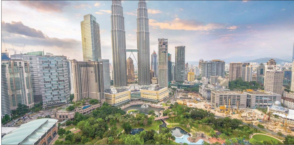
العاصمة الماليزية كوالالمبور... إحدى أسرع مدن آسيا نمواً

ماليزيا بلاد متعددة العناصر والإعراق يتجاوز عدد سكانها 33 مليون نسمة، وتعاين منذ أكثر من سنتين من اضطرابات سياسية ومحن اقتصادية وزعماء فاسدين، وفي الفترة الأخيرة انتظرت بفارغ الصبر حتى وقع اختيار ملك البلاد على السياسي المخضرم أنور إبراهيم لقيادة «حزب تحالف الأمل» لقيادة البلاد.