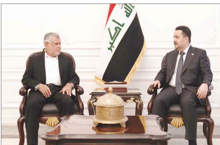
السوداني ورئيس «تحالف الفتح» هادي العامري خلال لقائهما أمس

ويحسب وسائل إعلام محلية، فإن مجمل التغييرات التي شهدتها الشهر الأول من حكومة السوداني شملت أكثر من 900 منصب، في الداخلية والأمن الوطني والمخابرات، لكن مصادر مقربة من الحكومة تقول إن «تداول هذه الأرقام ينطوي على مبالغة سياسية». وتعهد السوداني، منذ أن تولى منصبه مطلع الشهر الماضي، بأن تكون «قرارات حكومته تحت مظلة القانون والدستور». لكن التغييرات الأخيرة، وسبب عددها الكبير دفعة واحدة، تثير تساؤلات ذات طابع سياسي في الرأي العام العراقي. ومن الواضح أن المسؤولين الأمنيين المقلين أخيراً، محسوبون على رئيس الحكومة السابق مصطفى الكاظمي. وفيما تتوقع مصادر موثوقة