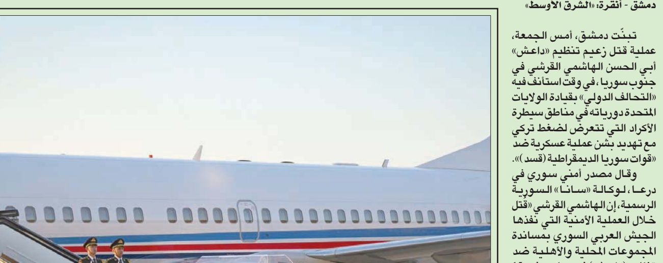
دمشق - أنقرة، «الشرق الأوسط» تبنت دمشق، أمس الجمعة، عملية قتل زعيم تنظيم «داعش» أبي الحسن الهاشمي القرشي في جنوب سوريا. في وقت استأنف فيه «التحالف الدولي» بقيادة الولايات المتحدة دورياته في مناطق سيطرة الأكراد التي تتعرض لضغط تركي مع تهديد بشن عملية عسكرية ضد «قوات سوريا الديمقراطية (قسد)».

تندد بـ «الشرق الأوسط» تجددت المسيرات المناهضة للنظام الإيراني في عدة مدن بمحافظة بلوشستان، ورد المحتجون هتافات منددة بالمرشد الإيراني علي خامنئي، وأخرى مؤيدة في الوقت نفسه لإمام جمعة زاهدان؛ رجل الدين السني البارز عبد الحميد إسماعيل زهي، بعد أيام من تسريب وثائق تكشف عن خطط محتملة لاستهدافه. وظهرت تسجيلات الفيديو مسيرات في مدينة زاهدان، بحضور لافت للمرأة، واستخدمت قوات الأمن الرصاص الحي والغاز المسيل للدموع، لتفريق