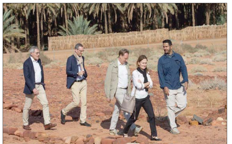
انطلقت أول بعثة أثرية سعودية - فرنسية من مدينة الحجر التاريخية بالعلا عام 2002

فريق التنقيب في مملكة دادان، لاكتشاف المزيد من المعلومات عن تاريخها الحضاري الذي امتد لأكثر من 2500 عام، والتي خضعت لحكم حضارة لحيان لعدة قرون.