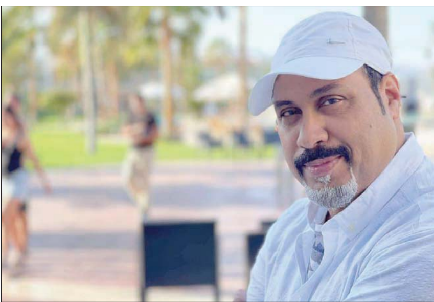
المسرحي السعودي سامي الجمعان

سامي الجمعان هو كاتب ومخرج وممثل سعودي من مواليد مدينة الأحساء (شرق السعودية) عام 1968، حاصل على الدكتوراه من كلية الآداب بجامعة الملك سعود، كتب ما يزيد عن 25 نصاً مسرحياً سعودياً، وشارك ممثلاً في عدة أعمال، أبرزها مسلسل «الدوائر»