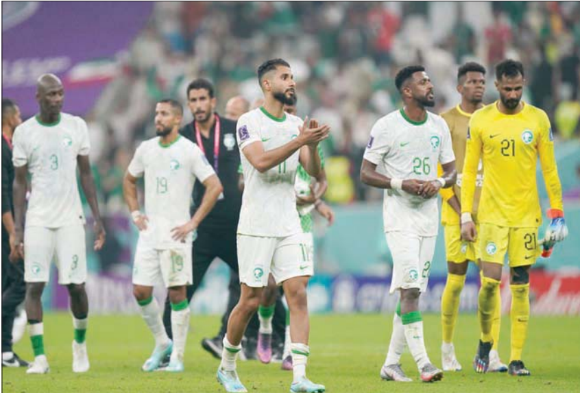
لاعبو الأخضر متأثرون بعد الوداع للمونديال

وشدد على ضرورة الشعور باننا نملك منتخباً قوياً وعظيماً، والاستمرار