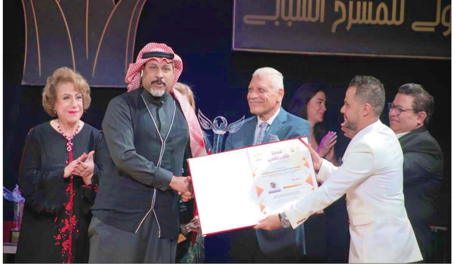
جانب من تكريم الجمعان في مهرجان شرم الشيخ الدولي للمسرح الشبابي

حالياً تأتي وفقاً لتخطيط ودراسة على أعلى مستوى: «الافتتاح الذي تعيشه المملكة هو خطوة مهمة للغاية كان لا بد من أن تتم منذ فترة طويلة، والحمد لله أنها تمت بشكل مدروس ومخطط على أعلى مستوى، فما يحدث حالياً في السعودية ليس وليد الصدفة، لكن وفق خطوات ممتدة، لها أهداف، منها أهمية الانفتاح على الفنون والثقافات كافة، من خلال التواصل مع الثقافات الأخرى كافة، وليس العربية فقط».