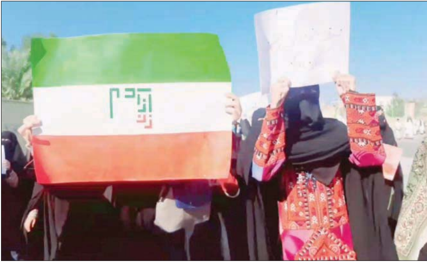
نساء يرفعن شعار «المرأة الحرة الحيا» في زاهدان أمس (تويتر)

وواصل إسماعيل زهي توجيه الانتقادات اللاذعة للمسؤولين، وهذا الأسبوع انتقد توجيه تهمة «المحاربة» ضد المحتجين، حسبما نقل موقعه الإلكتروني على شبكة «تلغرام». وقال «المحاربة وفق القرآن، إذا كانت مسلحة، الاحتجاج برشق الحجارة والعصي وترديد الهتافات ليست محاربة»، محذراً القضاة من تبعات إصدار أحكام الإعدام في يوم الحساب.