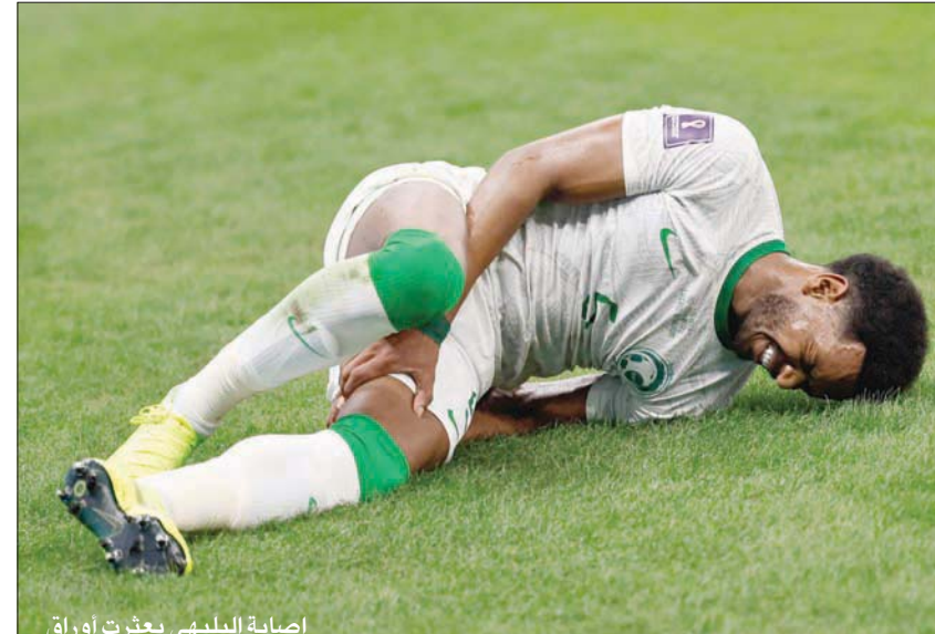
إصابة البليهي بعثرت أوراق رينارد أمام المكسيك

وشدد العبدلي على ضرورة تعزيز الجوانب الإيجابية التي خرجت بها مشاركة الأخضر في المونديال إلى جانب معالجة الجوانب السلبية لتلافيها مستقبلاً، منوهاً بأن المشاركة بشكل