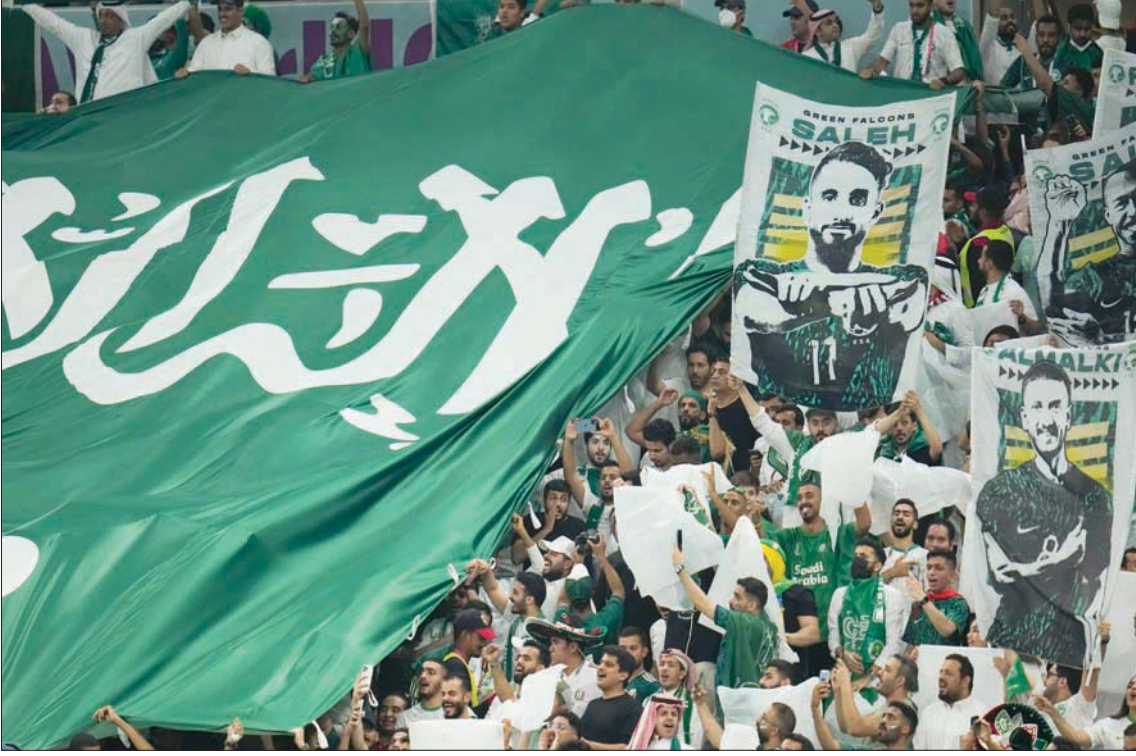
الجمهير السعودية كانت تمنى النفس بتكرار إنجاز التأهل إلى الدور الثاني في المونديال