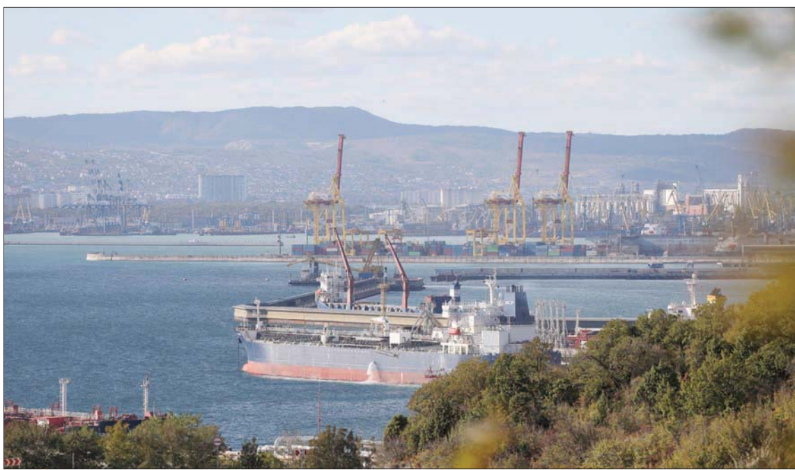
ناقلة نفط ترسو في نوفوروسيسك بروسيا