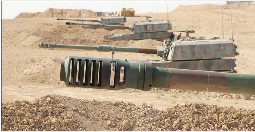
قوة عسكرية تركية على الحدود مع سوريا

وتابع بأنه في المحادثات الأخيرة مع الحلفاء، في إشارة إلى الولايات المتحدة التي تدعم «قسد» في إطار الحرب على «داعش»، تم توجيه التحذيرات والتذكير اللازم لهم بشأن عدم دعم تلك التنظيمات وإشعار إلى أن «سواقتنا» من يعتبرون تنظيم داعش الإرهابي خطراً وهم على بعد آلاف الكيلومترات، يحاولون عرقلة إجراءاتنا الضرورية ضد التنظيمات الإرهابية التي تستهدف مناطقنا المدنية، بما في ذلك المدارس، ونقل مواطنينا الأبرياء... هذه المحاولات غير مقبولة». وأكد أن تركيا هي الدولة الوحيدة من بين الدول الأعضاء في