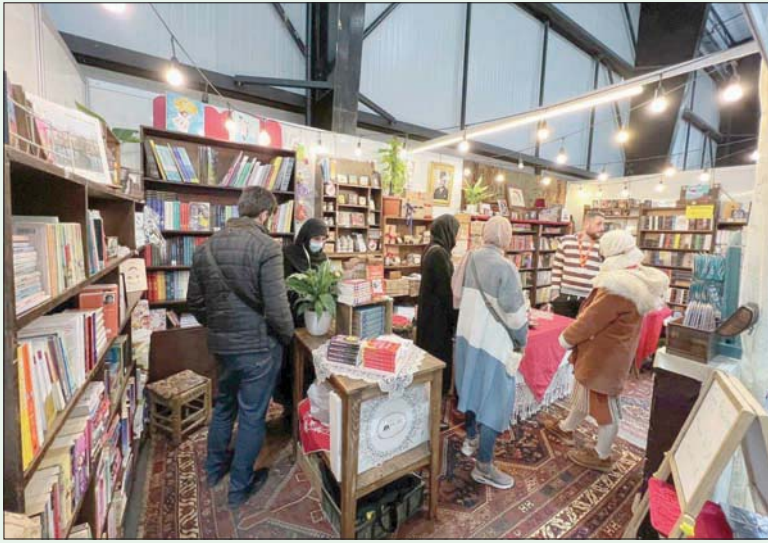
يستمر المعرض لغاية 11 ديسمبر

وتحضر له أفضل ما لدينا». لذلك أعدت «الآداب» العديد من الإصدارات المهمة لهذه المناسبة.