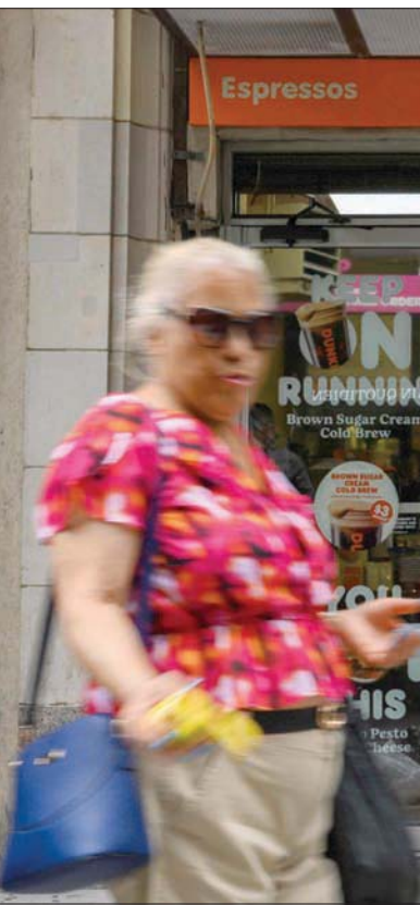
أميركيون يمشون بجانب محل في مدينة نيويورك الأميركية عليه لافتة تقول «الدينا وظائف الآن» (أ.ب)

الجلسة. ونزلت العقود الأميركية الآجلة للذهب 0,1 بالمائة إلى 1813,30 دولار للاوقية. لكن أسعار الذهب زادت بنحو 2,5 بالمائة هذا الأسبوع. وتماسك مؤشر الدولار خلال أمس، لكنه اتجه نحو تكبد خسارة أسبوعية بنحو واحد بالمائة متأثرا بتوقعات بلوغ أسعار الفائدة الأميركية ذروتها. ويخضع نزول الدولار سعر الذهب للمشتريين من حائزي العملات الأخرى. وقال هاريس في. رئيس أبحاث السلع في جيوجيت للخدمات المالية إنه حدثت تصحيحات للدولار بعد تصريحات رئيس مجلس الاحتياطي الفيدرالي جيروم باول يوم الأربعاء مما دعم جاذبية الذهب. وكان باول قال هذا الأسبوع إن الوقت قد حان لإبطاء وتيرة رفع الفائدة. وابتقت أسعار الفائدة المرتفعة على مكافة الذهب التقليدية حوسيلة للتحوط من التضخم هذا العام. وقال كريستوفر وونغ الخبير الاستراتيجي في أو.سي. بي سي لتبادل العملات «إن البيانات الضعيفة لنمو الأجور ووظائف القطاعات غير الزراعية ستجمع كل العوامل التي تؤدي إلى المزيد من انخفاض الدولار وهذا من شأنه أن يعود بنفع أكبر على الذهب. ومع ذلك، فإن بيانات قوية مفاجئة في التقرير قد توقف صعود الذهب، خاصة مع تداول الأسعار بالقرب من مستوى المقاومة الرئيسي». وبالنسبة للمعادن النفيسة المتعددة والمنتجات المعدنية، أوضاع الرئيس التنفيذي للشركة السعودية للصناعات العسكرية المهندس وليد أبو خالد أن الشركة نجحت في الدخول لقائمة أكبر 100 شركة متخصصة بالصناعات الدفاعية، متوقعا أن تصبح ضمن أفضل 25 شركة قبل حلول عام 2030،