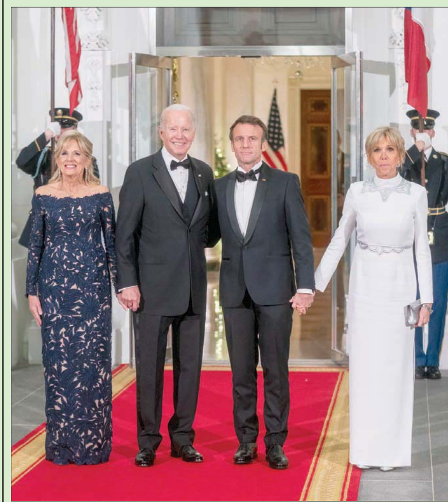
الرئيسان الأميركي وبايدن والفرنسي ماكرون مع قرينتهما في صورة تذكارية بالبيت الأبيض

القاهرة، حازم بدر كشفت دراسة ألمانية حديثة أن تأثير عقار «راباميسين» الواعد لمكافحة الشيخوخة، يبدو أنه سيكون أكثر «فاعلية» عند النساء مقارنة بالرجال. وباستخدام نموذج «ذباب الفاكهة»، وجد باحثون من معهد ماكس بلانك لبيولوجيا الشيخوخة في كولونيا بالمانيا، وجامعة لندن كولينج في بريطانيا، أن «العقار يطيل عمر إناث ذباب الفاكهة» فقط، ولا يبدو فعالاً مع الذكور. وخلال الدراسة، المنشورة (الخميس) في دورية «نيتشر إيجينغ»، وجد الباحثون، أن «راباميسين» أدى إلى إطء تطور التغيرات المرضية المرتبطة بالعمر في القناة الهضمية عند إناث الذباب، وخلصوا إلى أن الجنس البيولوجي هو عامل حاسم في فاعلية الأدوية المضادة للشيخوخة. ومادة «راباميسين»، منشطة لنمو الخلايا وهي منظم مناعي يستخدم عادة في علاج السرطان، وبعد زرع الأعضاء، وأخيراً وجدوا أن لها فوائد بوصفها مضاداً للشيخوخة، حيث أثبتت دراسات عدة سابقة أن هذه المادة المكتشفة في تربة جزيرة إيستر في تشيلي، لها فوائد مضادة للشيخوخة، حيث جعلت الخلايا البشرية في المختبر تتصرف، مثل الشابة. وفي الفئران، أثبتت