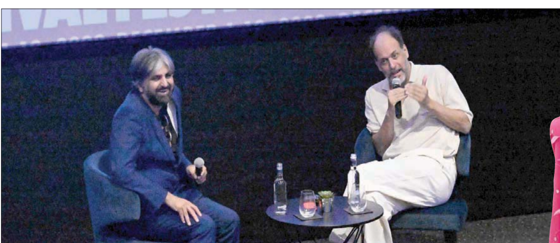
حوار مع المخرج لوكا جوادانينو (يمين) الفائز بجائزة «الأسد الفضي» (أ.ف.ب)

ماسييري»، وفيلم الدراما «ميليسا بي»، حقق بعد ذلك نجاحاً كبيراً مع فيلم الدراما الرومانسية «أنا الحب» (2009)، ثم بطولة تيلدا سوينتون. ثم فيلم «دقة كبيرة» (2015)، الذي أحدث ضجة، هو أول فيلم له باللغة الإنجليزية. وعزز لوكا مكانته فناناً من خلال تقديمه للممثل تيموثي شالاميه في فيلم «نادي باسك» (2018)، ومن ثم أعاد ليم شمل سوينتون وداكوتا جونسون في الفيلم الكلاسيكي «جيبالو» المعاد إنتاجه للمخرج داريو أرجينتو في الأصل، واستمر شغفه بفتة الربع من خلال مسلسل «إتش بي أو» الرابع «نحن ما نحن عليه». حيث تعمق لأول مرة في عالم أكل لحم البشر وهو الموضوع الذي استكمل استكشافه في فيلمه المدهش «العظام وكل شيء» (2022)، الذي يُعرض في الدورة الثامنة من المهرجان 2022.