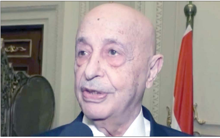
صورة لرئيس مجلس النواب الليبي عقيلة صالح من مقطع فيديو خلال وجوده بمجلس النواب المصري

محفوظة، أنا أحترم التزاماتنا وتعهداتنا، ويجب أن تكون العلاقة مع الشعب الليبي ودون الأشخاص». في غضون ذلك، أصدر رئيس حكومة الوحدة في