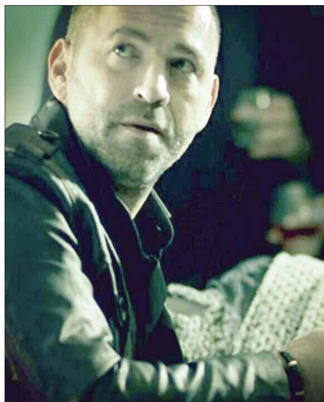
لا تهمه البطولات بقدر مساحات تمثيلية أكبر