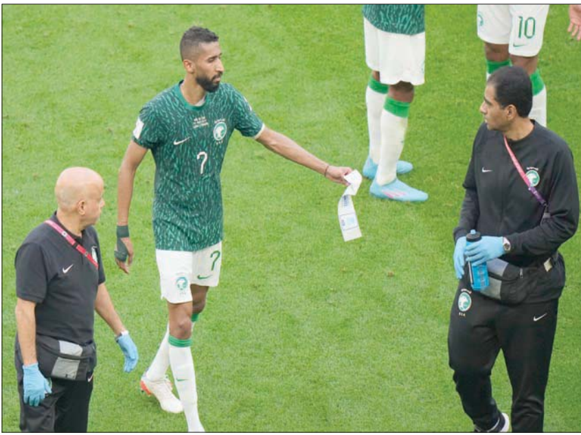
القائد سلمان الفرج ترك فراغاً لم يتمكن المدرّب من ملئه في وسط الأخضر

وأضاف: «أمام المكسيك كانت طريقة اللعب غير مناسبة، ومن الصعب أن تلعب بمصالح النعمة أو أحمد جميل كظهير، وتلعب بعنصر ظهير كمحور ارتكاز... الإصابات تحصل في كرة القدم، وفؤاد أنور كان موقوفاً في مواجهة بلجيكا 94، ولعب حمزة صالح كبديل عنه... ودوماً لا بد أن تكون هناك خيارات فنية تتيح للمدرّب الاختيار منها، وكان من الممكن أفضل مما كان».