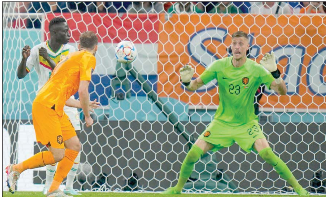
نوبيرت يستعد لصد تسديدة خلال مواجهة السنغال

ويمكنني أن ارتكب الأخطاء، ولست خائفاً أو قلقاً من ذلك. لقد كانت المباراة الأولى التي لعبناها ضد السنغال لحظة استقنائنا بالنسبة لي. عندما نزلت إلى أرض الملعب وسمعت الشئد الوطني لمنتخب بلادي، كانت هذه لحظة استثنائية حقاً؛