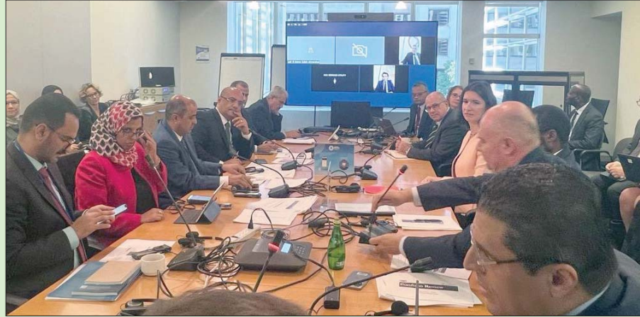
وزراء يمينيون يعقدون اجتماعاً مع مسؤولين في البنك الدولي

لدعم المجتمعات والمؤسسات الرئيسية الأكثر ضعفاً. كما أنه يتماشى مع إطار عمل البنك الدولي للاستجابة للأزمات العالمية حيث يسهم في تحقيق الأهداف الرئيسية للاستجابة لتعدام الأمن الغذائي، و«تعزيز القدرة على الصمود» ويشير البيان إلى أن برنامج البنك الدولي الخاص باليمن وصل إلى 3,3 مليار دولار أميركي في شكل منح من المؤسسة الدولية للتنمية منذ عام 2016، بالإضافة إلى التمويل، كما يوفر البنك الدولي الخبرة الفنية لتصميم المشاريع وتوجيه تنفيذها من خلال بناء شراكات قوية مع وكالات الأمم المتحدة والمؤسسات المحلية العاملة على الأرض.