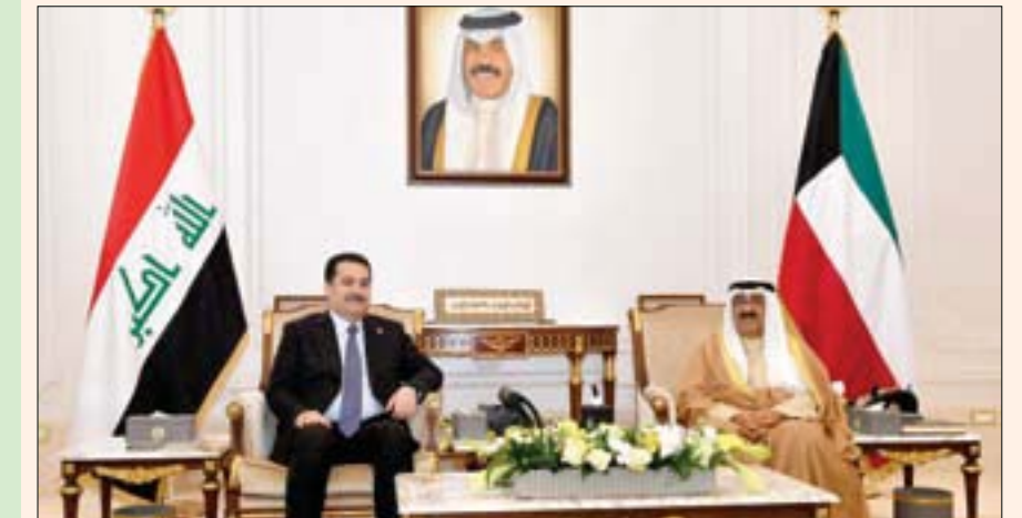
الشيخ مشعل الأحمد الصباح مستقبلاً السوداني أمس

الشيخ مشعل الأحمد الصباح رئيس الوزراء العراقي محمد شياع السوداني. وقالت وكالة الأنباء العراقية إن اللقاء ركز على «السعي لحل العديد من الملفات وفق ما يدعم المصالح المشتركة»، وأضافت أن ولي العهد الكويتي أكد «حرص الكويت على دعم استقرار العراق وإزدهاره». وذكر المكتب الإعلامي لرئيس الوزراء العراقي، في بيان، أن السوداني التقى ولي عهد الكويت الشيخ مشعل الأحمد الصباح، وأنه جرى خلال اللقاء التباحث بشأن العلاقات الثنائية بين البلدين وسبل توحيدها، في إطار الروابط التاريخية التي تجمعها، والتأكيد على إدامة التعاون المتبادل، على مختلف المستويات»، مشيراً إلى «استمرار