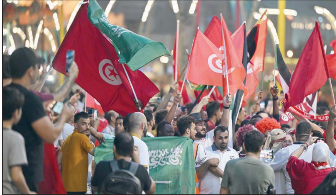
المشجعون العرب احتفلوا إلى جانب أشقائهم السعوديين في ميادين الدوحة

وضحت مواقع التواصل الاجتماعي بمنشورات الاحتفاء بالفوز السعودي، مع مشاركة عدد كبير من الصور التي تسخر من الفريق الأرجنتيني. كما أنهالت التهاني