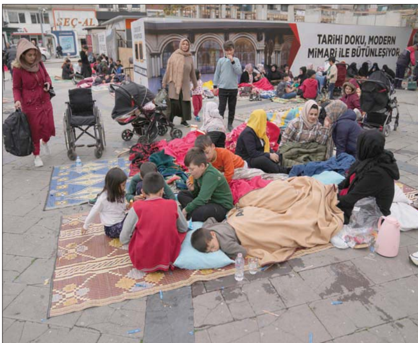
أثراك يفترشون أحد الشوارع بعدما تركوا منازلهم بعد الزلزال في مدينة دوزجة أمس (أ.ب)

الحزب «العدالة والتنمية» الحاكم الأربعاء، أن حكومته عملت على مدى 20 عاماً على تهيئة بيئة تحتية مناسبة لمقاومة الزلازل. وأشار إلى أن المؤسسات المعنية تقوم بحصر المباني المتضررة في دوزجه وستقوم