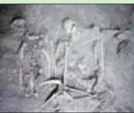
واشنطن - لندن: «الشرق الأوسط»

استخدمت أثنى «قرد عنكبوت» قبل 1700 عام بوصفها هدية لتقوية الروابط بين قوتين رئيسيتين في أميركا الجنوبية ما قبل كولومبوس، ثم جرت التضحية بها بدفنها حية، وفقاً لدراسة جديدة. ويُرجّح أن أشخاصاً بارزين من حضارة المايا قدموا هذه الهدية الثمينة إلى حضارة أخرى في تيوتيهواكان، وفقاً لدراسة نشرت في مجلة PNAS. هذا الأسلوب دبلوماسي الباندا التي مارستها الصين في تطبيع علاقاتها مع الولايات المتحدة في سبعينات القرن العشرين. وباستخدام تقنيات عدة مثل استخراج الحمض النووي القديم، أو التاريخ بالكربون، أو حتى تحليل النظام الغذائي، نجح الباحثون في إعادة تكوين مسار حياة الحيوان ونفوقه، وتبين لهم أنه دُفن حياً عندما كان يبلغ ما بين 5 و8 سنوات. ويبدأ عمل فريق البحث باكتشاف ناوا سوغياما المفاجئ عام 2018 بقايا الحيوان في موقع تيوتيهواكان الأثري الذي تصنّفه اليونسكو بين مواقع التراث العالمي، ويقع في الهضاب القاحلة في المكسيك الحالية. ولاحظت الأبحاث الرئيسية للدراسة ناوا سوغياما؛ من جامعة كاليفورنيا، لـ«وكالة الصحافة الفرنسية»، أن وجود القرد العنكبوت ليس مالوفاً في هذه المنطقة، إذ هي ليست موطناً