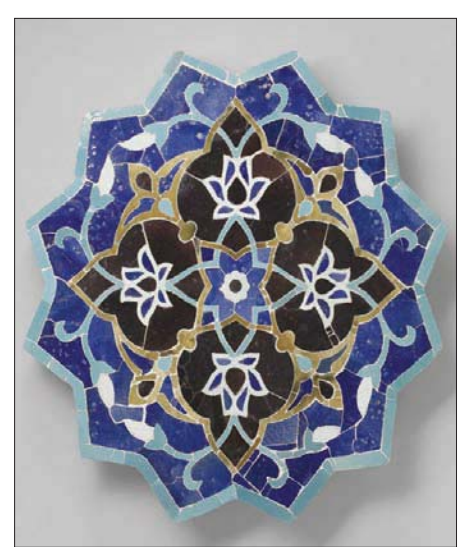
روائع خزف آسيا الوسطى (الشرق الأوسط)