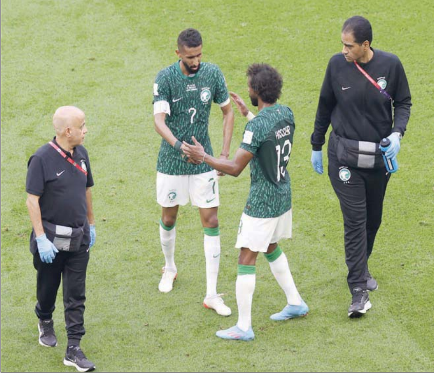
الأخضر خسر خدمات الفرج والشهراني في المونديال

السعودي، ويسألون: «هل حقاً توقعتم الفوز؟».