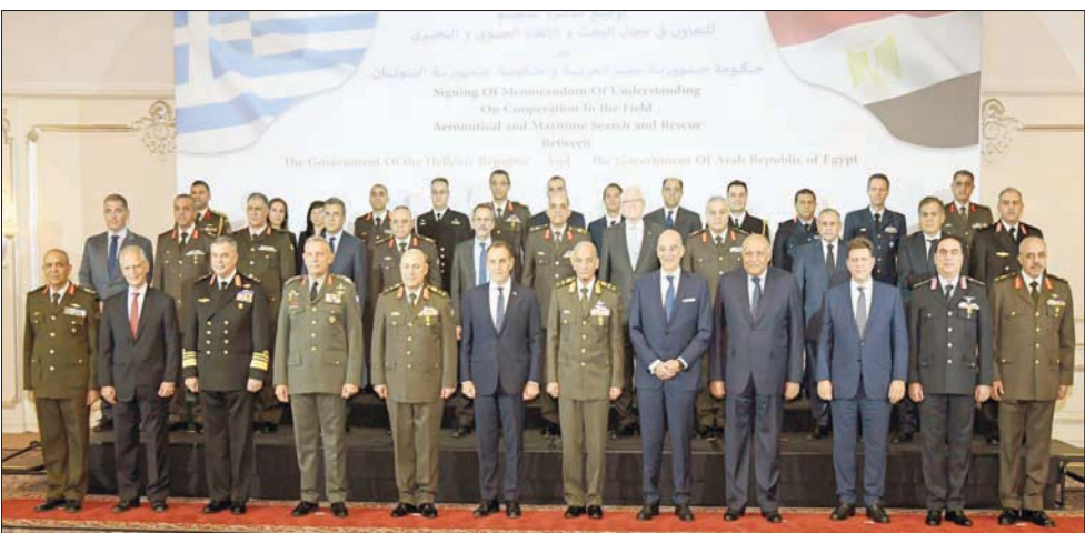
مسؤولون مصريون ويونانيون خلال توقيع مذكرة تفاهم عسكرية في القاهرة أمس

مواجهة التحديات المشتركة». واستقبل شكري نظيره اليوناني نيكوس ديندياس في القاهرة، حيث أكد خلال اللقاء «مق علاقات التعاون التي تربط بين البلدين في شتى المجالات»، وأصفا العلاقات بين البلدين بأنها «قوية واستراتيجية».