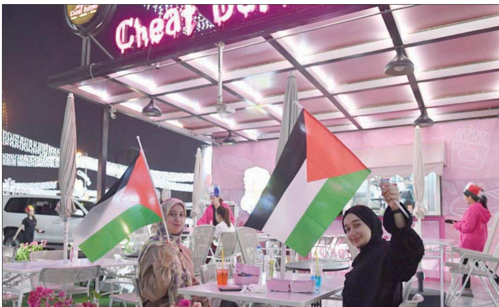
إحصائيات رسمية تفصح عن ارتفاع العجز التجاري الفلسطيني ليخطى نصف مليار دولار (رويترز)

وأوضح التقرير أن القوة القائمة بالاحتلال تقدم حوافز سخية للمستوطنين ورجال الأعمال لتيسير المشاريع الصناعية والزراعية، ما شجع مئات الآلاف من الإسرائيليين على الانتقال إلى المستوطنات المدعومة، حيث مستويات المعيشة في المتوسط أعلى مما هي عليه في إسرائيل، وتشمل القوة القائمة بالاحتلال 70 في المائة من المنطقة «سي» داخل حدود المجالس الإقليمية للمستوطنات، مما يجعل ذلك الجزء محظورا على التنمية الفلسطينية، وذلك رغم أنه يمثل الجزء الأكبر المقرب في الضفة الغربية ويضم أكثر الأراضي الزراعية خصوبة وأكثر الموارد الطبيعية قيمة، وما زال وصول الفلسطينيين إلى 30 في المائة المتبقية من المنطقة «سي» مقيدا بشدة. وقد أدت القيود التي فرضتها القوة القائمة بالاحتلال إلى