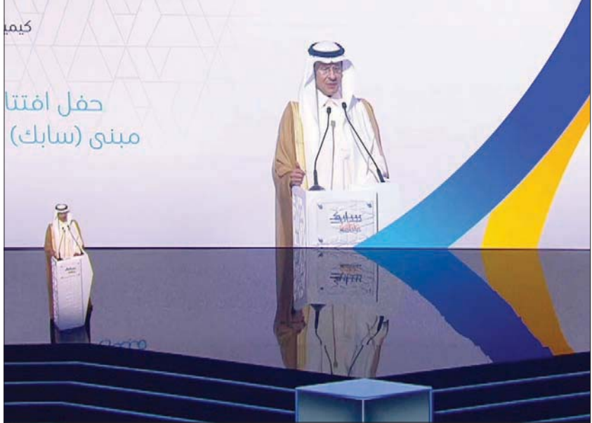
وزير الطاقة السعودي يعلن أمس عن التوسع في صناعة البتروكيماويات التحويلية بالسعودية

سوفور نحو مليون برميل نفط مكافئ يومياً بحلول عام 2030، وبالنسبة لقطاع البتروكيماويات المتخصصة. للاستفادة من السوائل النفطية في إنتاج البتروكيماويات. ولفت إلى أن المنظومة تعزز زيادة الطاقة الإنتاجية القسوى المستدامة للمملكة، من البترول الخام، إلى 13 مليون برميل يومياً، الأمر الذي سيساهم في توفير لقيم إضافي يدعم نمو قطاع البتروكيماويات. وأضاف أن المنظومة تعمل على تطوير حقول الغاز وعلى رأسها حقل الجافورة، لإنتاج أكثر من 630 ألف برميل يومياً من سوائل الغاز الطبيعي والكحولات، وأكثر من 380 مليون قدم مكعبية قياسية في اليوم من غاز الأيثان، وهو ما سيساعد على توفير فرص للتوسع بشكل أكبر في صناعة البتروكيماويات. وزاد الأمير عبد العزيز في كلمته أن الاستراتيجية المتكاملة لقطاع البتروكيماويات في المملكة في مراحلها النهائية، حيث تتضمن جميع