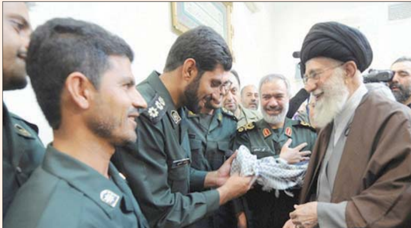
صورة نشرها موقع «المشهد» الإيراني للعقيد القتيل في سوريا

مقتل العقيد الإيراني، لكن «المركز السوري لحقوق الإنسان» قال إن جعفري اغتيل مع مرافقه السوري الجنسية باستهداف اليتهما بعبوة ناسفة بالقرب من منطقة السيدة زينب جنوب العاصمة دمشق. ويُعد جعفري أرفع مسؤول في «الحرس الثوري» الإيراني يُقتل في سوريا منذ 23 أغسطس (أ ب)، حين أعلنت طهران مقتل الضابط أبو الجوفضاء، الشابعة للحرس الثوري في سوريا، على يد عملاء الكيان الصهيوني، بانفجار عبوة ناسفة على الطريق قرب دمشق». وأكد البيان أن «الكيان الصهيوني المزيف والمجرم سيتلقى الرد بلا شك».