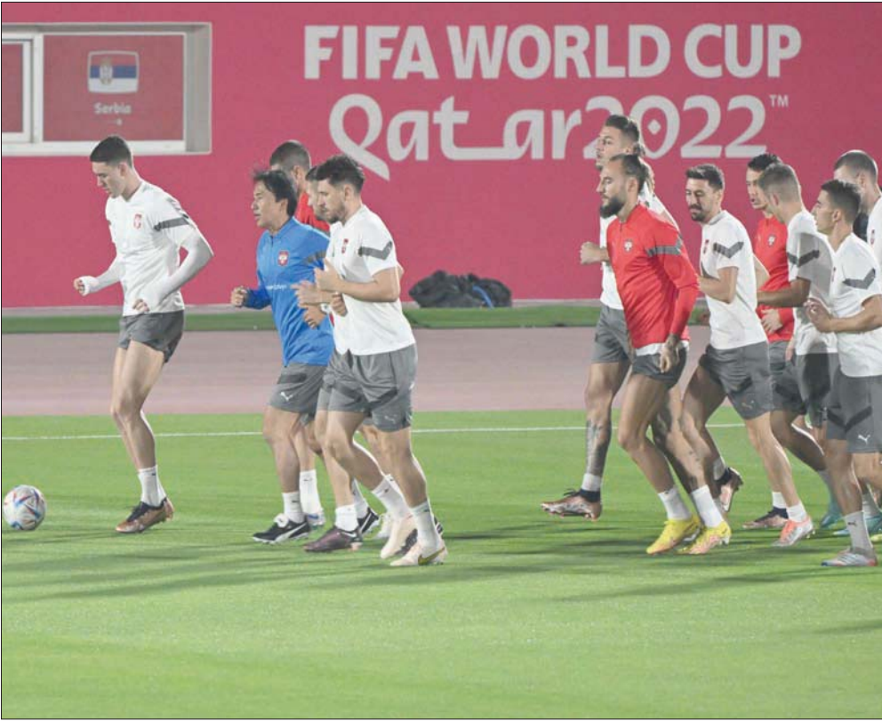
منتخب صربيا يواجه البرازيل بفريق يضم مجموعة من النجوم