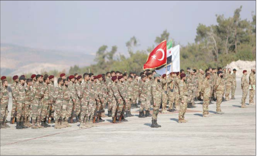
قوات تابعة لـ«الواء سمرقند» الموالي لأنقرة في عفرين الأربعاء

الهجوم الذي استهدف إسطنبول وادى إلى مقتل 6 أشخاص وإصابة 81 آخرين. وعبر عبيد عن «خيبة أمه تجاه الرد الضعيف لروسيا والولايات المتحدة على عشرات الغارات الجوية التركية التي استهدفت مناطق سيطرة قواته وقتل فيها 11 شخصاً هذا الأسبوع»، بحسب موقع «البيزنور» الأميركي. ورأى أن الغزو الروسي لوكراينا «عزز من قيمة تركيا في نظر روسيا والغرب على حد سواء».