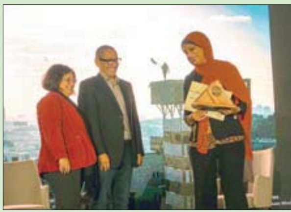
أثناء توزيع الجوائز