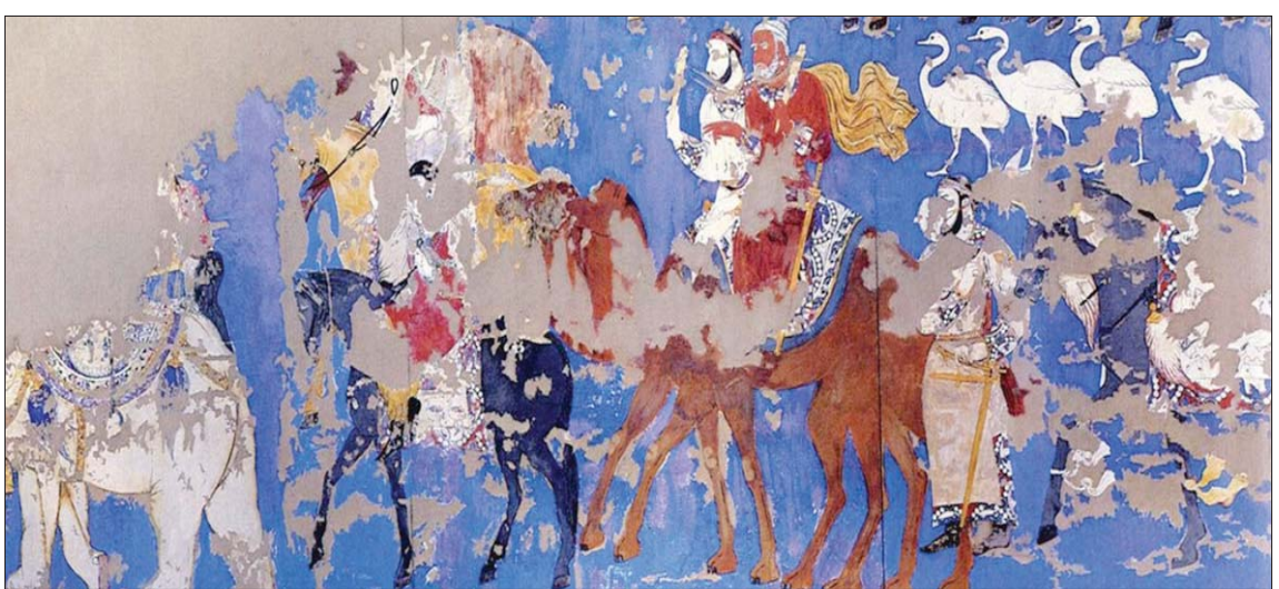
قافلة باللون الأزرق