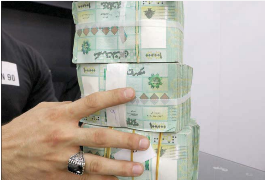
كيات من العملة اللبنانية التي فقدت قدراً كبيراً من قيمتها في أحد محلات الصرافة

بيروت: علي زين الدين تبدأ الحكومة اللبنانية استفتاء الرسوم الجمركية بزيادة عشرة أضعاف بدءاً من مطلع شهر ديسمبر (كانون الأول) المقبل، حسبما أعلنت وزارة المال أمس، عادة إعلان حاكم مصرف لبنان عن رفع سعر الصرف الرسمي للدولار عشرة أضعاف، بدءاً من شهر فبراير (شباط) المقبل، ليصبح 15 ألف ليرة، وذلك في خطوة ينظر إليها البعض على أنها إجراء لحصر سعر صرف الدولار في السوق بثلاثة أسعار، هي سعر منصة السوق الموازية البالغ الآن نحو 40 ألف ليرة للدولار، وسعر منصة «صيرفة» العائدة للمصرف المركزي، البالغ 30 ألف ليرة، وسعر المصرف الرسمي للسحوبات المصرفية والرسوم الجمركية البالغ 15 ألف ليرة.