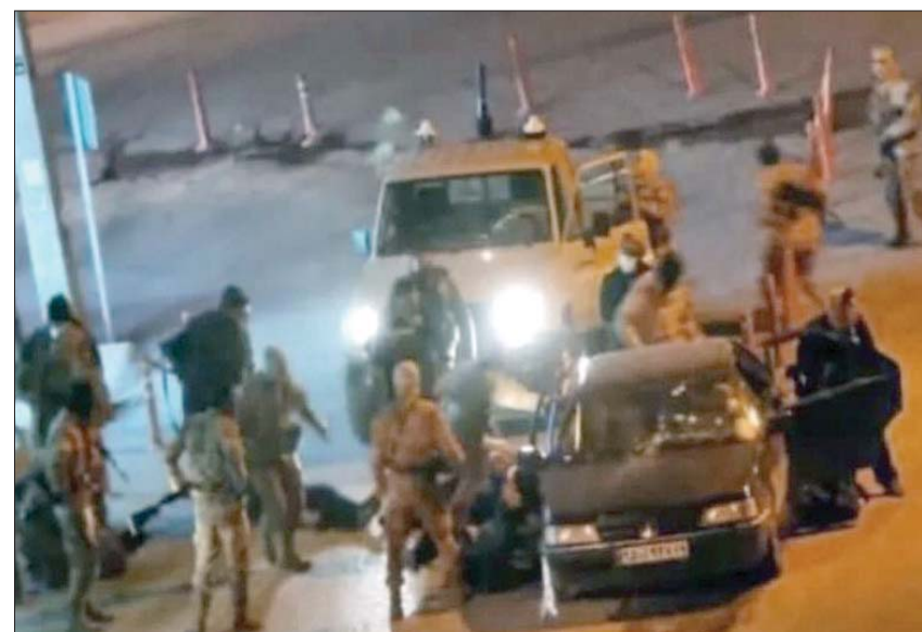
نقطة تفتيش لـ «الحرس الثوري» في مدينة جوانرود بمحافظة كردستان

إلى ذلك؛ نفى حسين هاشمي، نجل الرئيس الأسبق علي أكبر هاشمي رفسنجاني، تقريراً نشرته صحيفة «وول ستريت جورنال»، ذكر أن الأمين العام لمجلس الأمن القومي، علي شمخاني، طلب الشهر الماضي من أسرة رفسنجاني وكذلك المرشد الإيراني الأول (الخميني) التدخل لتهنئة الشارح. وأضافت أن شمخاني قدم عرضاً يمنح بعض الحريات التي يطالب بها المحتجون. وأشارت الصحيفة الأميركية إلى «رفض العرض من أسرتي هاشمي رفسنجاني والخميني». ونقل موقع الرئاسة الإيرانية عن رئيسي قوله؛ خلال الاجتماع الأسبوعي للحكومة الإيرانية، أن «الحكومة لديها أذان صاغية لكلام الاحتجاج والمعارضة، لكن الاحتجاجات تختلف عن أعمال الشغب والاضطرابات». وأضاف: «الاضطرابات تمنع الحوار وأي نوع من التنمية». ودافع رئيسي عن حملة القمع التي تشهنتها السلطات ضد الاحتجاجات، وقال إن «الناس تتوقع منا مواجهة حازمة». وعدّ «التدابير الأمنية بمثابة خطر للحكومة».