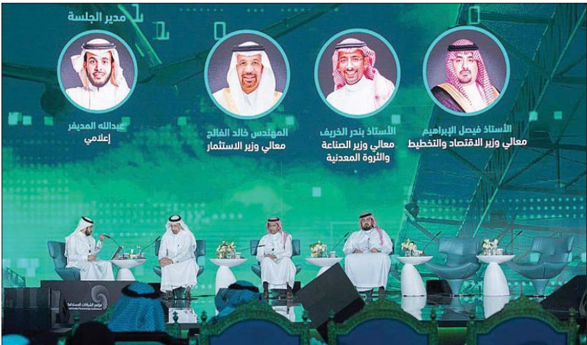
جانب من مؤتمر الشراكة المستدامة الذي انطلق أمس في الرياض بحضور وزراء سعوديين (الشرق الأوسط)

من جانب آخر، أكد وزير التعليم يوسف بنیان أن السعودية تمتلك فرصاً متميزة للمنافسة في السوق العالمية، حيث قال «لدينا 3 محطات في الثورة الصناعية الرابعة... كما لدينا فرص واعدة لتدريب وتوظيف الشباب، لصناعة جيل مبتكر». وأضاف إلى ذلك أهمية العمل لكي تستفيد الجامعة والباحثون من مشيراً إلى أن هذا التوجه سعودي لتحفيز الباحثين والجامعات وتحسين طموح السعودية فيما يخص البحث والابتكار. وزاد أن هدف البحث والتطوير هو إعطاء مساحة من حرية التفكير وقبول المخاطر وتقبل الأخطاء، وكذا التكامل بين الجامعات والعمل على الخاص، فمفصلاً عن المبادرات والبرامج التي تدعم منظومة البحث والابتكار في الجامعات.