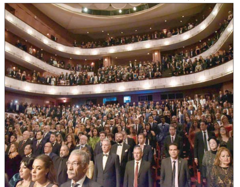
حضور لافت في المسرح الكبير بدار الأوبرا المصرية خلال حفل الختام