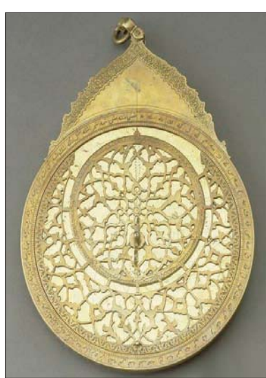
فنون صياغة النحاس (الشرق الأوسط)

ما توحى به من مظاهر تفوق الفنون الإسلامية في ذلك العصر. وجاء في دليل المعرض أن فن التطريز كان التعبير الرمزي عن حميمية المحيط العائلي، حيث نقشت البنات والأمهات جوانب من حياتهن؛ سواء المستقرة والمتنقلة... «قد استخدمن خطوط الحرير والذهب وترنك للألوان والنقوش أن تعبر عن أذواقهن بشكل عفوي، وهو ما يفسر التنوع المدهش في ذلك التراث». وكما في تطريزات الثوب النسائي الفلسطيني، التي تختلف من مدينة لأخرى، فإن النقوش التي جاءت منها في أوزبكستان، كانت