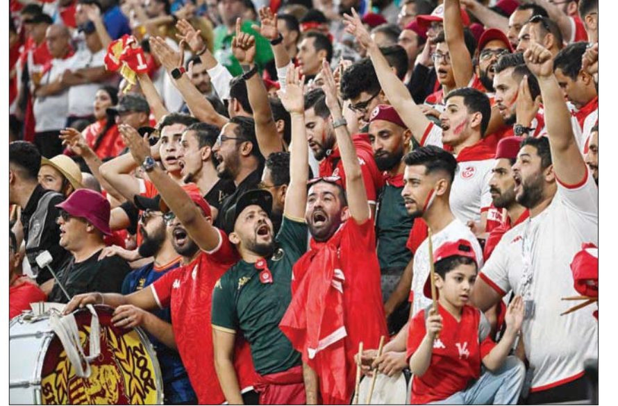
جماهير تونس سعيدة بأداء منتخبها في أولى مواجهاته مع الدنمارك

وقال دراغر، سنعسى لمواصلة تقديم أفضل ما لدينا بحضور جماهيري التونسي الكبير والذي كان رائعاً وهذا ليس بغريب على جمهور النور الذي سيكون الداعم الأول في كل المباريات.