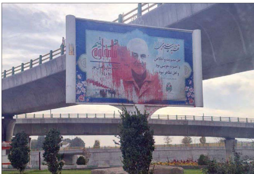
لافتة تحمل صورة قاسم سليمانى ملطخة بطلاء أحمر في كرمانشاه

خراسان. بالتوازي؛ كانت مدينة شيران بؤرة الحراك في محافظة فارس الجنوبية. أما محافظة بلوشستان؛ التي سجلت أكبر عدد من القتلى خلال الاحتجاجات، فقد كانت مدن زاهدان وخاش وتشابهار بؤرة المسيرات الاحتجاجية. وشهدت محافظات اصفهان واذربيجان، الشروز، وجيلان، والأحواز، احتجاجات متوسطة.