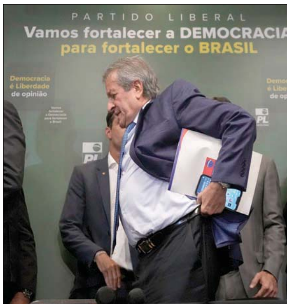
رئيس الحزب الليبرالي فالديمار كوستا نيتو، الموالي لبولسونارو

انصار الرئيس الأميركي السابق دونالد ترمب الذين رفضوا نتائج الانتخابات التي فاز فيها الرئيس الحالي جو بايدن. تجدر الإشارة إلى أن نتائج الانتخابات البرازيلية أصبحت رسمية منذ إعلانها المحكمة الانتخابية العليا نهاية الشهر الفائت، وفاز فيها لولا بنسبة 50,9 في المئة من الأصوات، مقابل 49,1 في المئة لبولسونارو. وفور إعلان النتائج الانتخابية، سارع إلى الاعتراف بها رئيس مجلس النواب، وهو حليف لبولسونارو، ورئيس مجلس الشيوخ، والمحكمة العليا بإجماع أعضائها. كما انضمت إلى هذا الاعتراف الحكومات الأجنبية، وفي طليعتها الولايات المتحدة، وتوجهت بالتهنئة إلى لولا لفوزه بولاية ثالثة رئيساً للبرازيل.