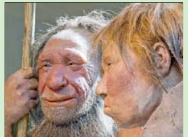
رجل وامرأة في متحف إنسان النياندرتال في ميتمان بألمانيا

تتند: «الشرق الأوسط» المعقد، وبالتالي ثقافة الطعام، لدى إنسان النياندرتال. وحاول هانت وزملاؤه إعادة طهي إحدى الوصفات على نظام غذائي يتكون من التوت الملعب ولحم الحيوانات النيء، فإعلان أن تعيد التفكير في الأمر مرة أخرى، حيث تم اكتشاف بقايا متفحمة لما يبدو أنه أقدم وجبة مطبوخة في العالم تم العثور عليها في مجمع كهوف في شمال العراق، مما أثار التكهات بأن إنسان النياندرتال ربما كان من عشاق الطعام، حسب صحيفة «الغارديان» البريطانية. ويقول كريست هانت، وهو أستاذ علم البيئة القديمة في جامعة «الفريلون جون موريس» البريطانية، والذي قام بتحقيق أعمال التنقيب: «تعد النتائج التي توصلنا إليها بمثابة أول مؤشر حقيقي لعملية الطهي