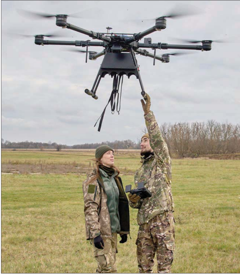
أوكرانيان يتدربان على تشغيل «مسيرة» قرب خاركيف في شرق أوكرانيا

بوماً. وإذا حصلت أوكرانيا عليها، فإنها «ستستطيع العثور على السفن الحربية الروسية في البحر الأسود ومهاجمتها، وكسرها حصارها القسري وتخفيف الضغوط المزروجة على الاقتصاد الأوكراني وأسعار الغذاء العالمية، وكان البيت الأبيض ووزارة الدفاع الأميركية قد رفضا طلب أوكرانيا الحصول على هذا النوع من الطائرات في وقت سابق من هذا الشهر. وأعرب المسؤولون الأميركيون عن قلقهم من إمكانية سرقة التكنولوجيا الموجودة على متنها، ومن احتمال أن تساهم في توسيع نطاق الحرب مع روسيا. وقالت وسائل إعلام أميركية، إن وزارة الدفاع ستعطي أولوية عالية لتوفير الطائرات الأميركية من دون طيار على الجيش الأميركي. وأضافت: «نحن دائماً نقيم ما يمكننا إرساله إلى أوكرانيا».