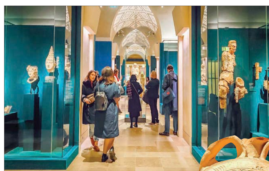
داخل أروقة المعرض