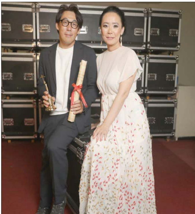
رئيسة لجنة التحكيم مع مواطنها الياباني الفائز بجائزة نجيب محفوظ لأفضل سيناريو