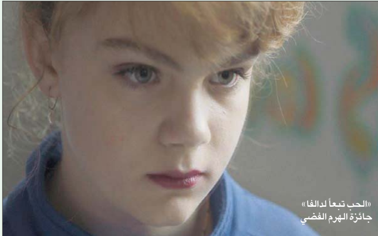
«الحب تبعاً لدافقا» جائزة الهرم الفضي

تلك الأفلام المستعدة جيدة؟ ماذا لو أن الأفلام التي تم استبدال تلك المُلغاة بها أقل مستوى؟ منذ متى كان على السينما أن تنتمي إلى معسكرات سياسية؟