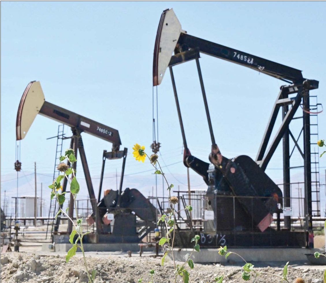
حفرات على الطريق السريع المعروف باسم طريق النفط شمال ماكيتريك في مقاطعة كيرن بكاليفورنيا

الطاقة الأميركية أصدرت بياناتها خلال النصف الثاني من الجلسة، والتي أوضحت فيها أنها تراجعت بأكثر من توقعات المحللين، في حين صعدت مخزونات البنزين والمخبرات.