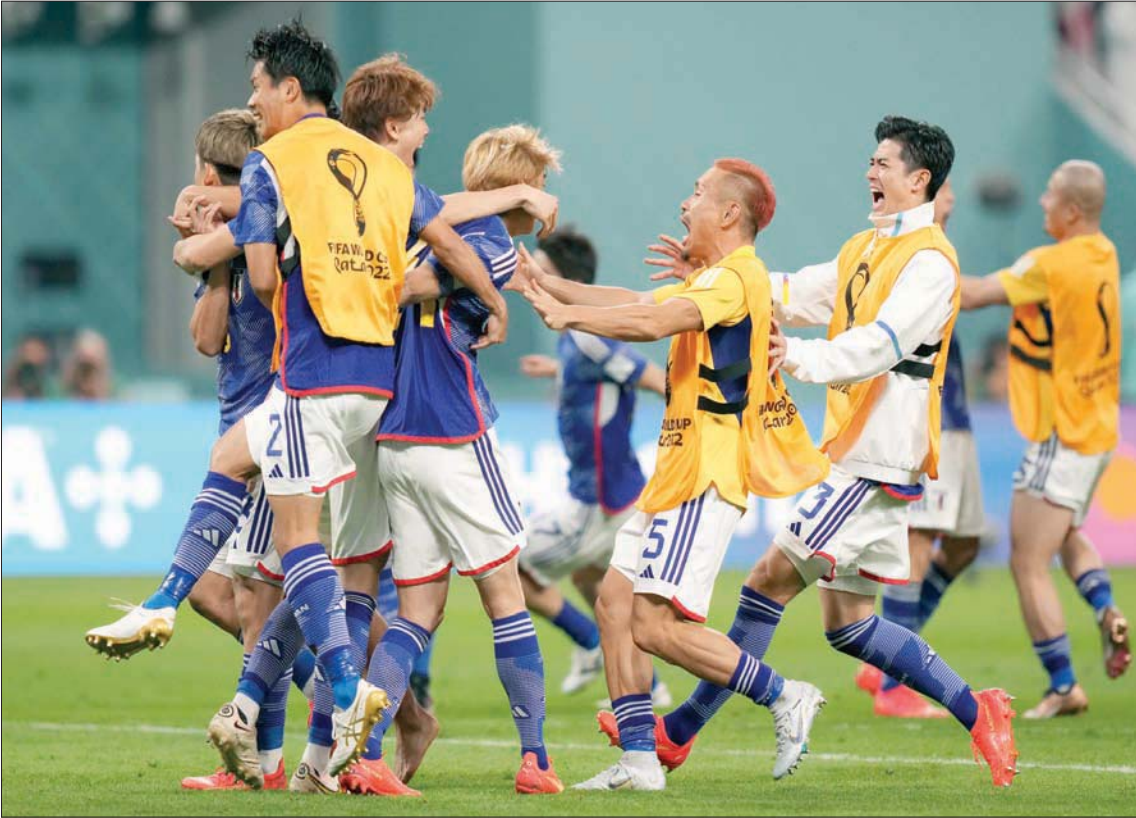
فرحة يابانية بعد الفوز التاريخي على ألمانيا