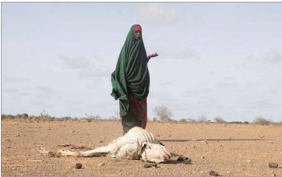
ناحزة قرب جيفة حيوان في منطقة ضربها الجفاف في الصومال في 26 مايو الماضي

وترى كار أن «مزيج تغير المناخ وانعدام الأمن سيؤدي إلى زيادة النزوح الداخلي وموجات الهجرة غير الشرعية من أفريقيا وإرهاق موارد كل من البلدان الأفريقية والأوروبية».