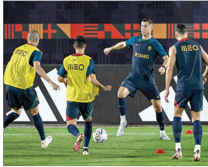
رونالدو في تدريبات البرتغال غير عابئ بالضجة التي فجّرها وأدت لانفصاله عن ناديه

وتحدث الكسندر دجيسكو المولود في مونتريال وهو مرشح للفوز على كوريا الجنوبية الفريق الذي يعتبر الحلقة الأضعف بالمجموعة اليوم على ملعب المدينة التعليمية. ويسجد هذا الصراع على المجموعة والفوز لاي منهما سيمتج