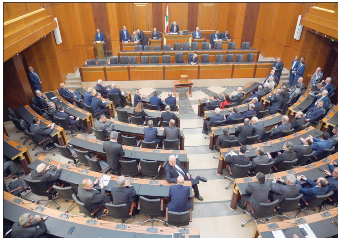
جلسة لجلس النواب اللبناني

عجز حتى الساعة عن إقناع باسيل بإخلاء الساحة لمصلحة فرنجية الذي لن يحرق المراحل بإعلان ترشيحه رسمياً، وإن كان هناك من يقول في الخفاي الشيوعي بأنه يتحفظ على ترشيحه، وإن يفرض عن قراره إلا عندما يتأكد بأن الطريق أصبحت سالكة لانتخابه. وفي المقابل، فإن المعارضة التقليدية تواجه صعوبة حتى الساعة في تجاوز أو في التخفيف من أضرار تعطلت بعدم قدرتها على تسجيل اختراق في صفوف النواب المستقلين من الطائفة السنية بعد أن تراجع ثلاثة منهم عن انتخاب معوض، مع أنهم يتصرفون وكأنهم في صلب المعارضة، فيما نحت في فتح قنوات للتواصل مع عدد من النواب التغييريين، وهذا ما سيحمله اليوم صندوق الاقتراع من أصوات لنواب منهم. ويبقى السؤال: هل كان باسيل مضطراً لحرق المراحل