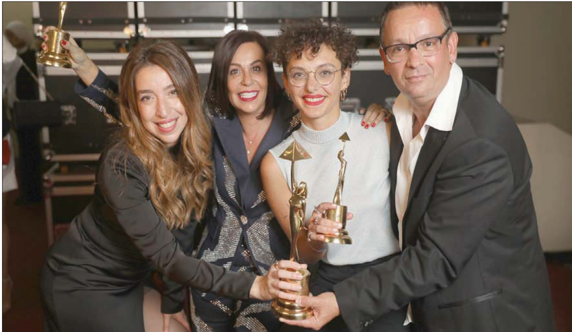
فريق الفيلم الفلسطيني «علم» المتوج بالهرم الذهبي

وشهدت هذه الدورة تميزاً كبيراً من أفلامها وانضباط فعاليتها، وفقاً للنقاد اللبناني إلياس خلط مدير مهرجان أيام بيروت السينمائية، قائلاً لـ«الشرق الأوسط»: «هذه الدورة شهدت انتقال الإدارة بشكل ناعم وسلس لم تشعر به، وشهدت تميزاً من ناحية الفعاليات والتنظيم، وتحسناً في الشكايات لوجستية، وبالنسبة لبرمجة الأفلام جاءت ممتازة على المستوى الدولي حيث وجدت أفضل الأفلام، غير أنه من المؤسف أن الأفلام العربية لم تكن بالمستوى الجيد، وأعني بها الأفلام ذات الإنتاج العربي الخالص، وهذا ما توقعه البعض بنتائج ما بعد مرحلة (كوفيد -19) التي تأثرت كثيراً بها، بينما الأفلام ذات الإنتاجات العربية