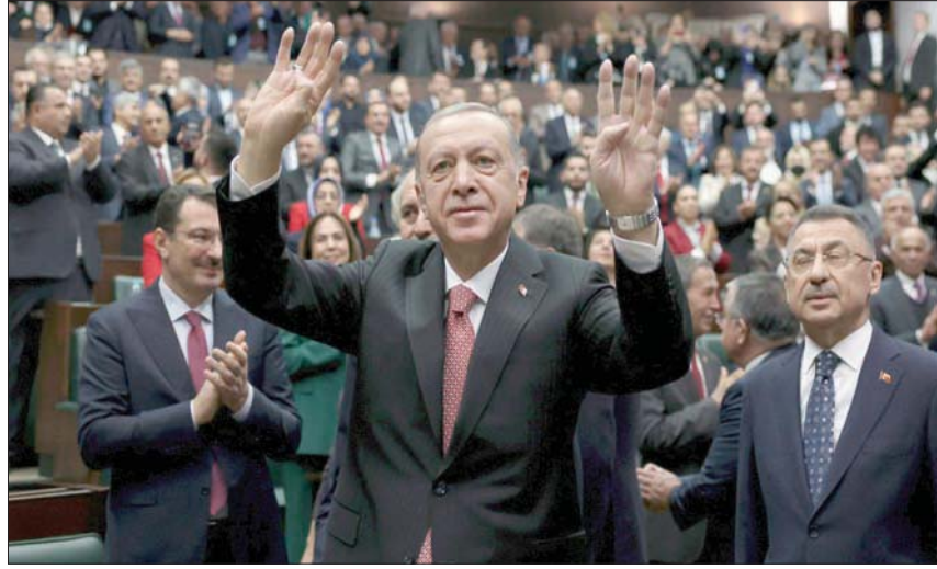
إردوغان لدى وصوله إلى اجتماع نواب حزبه في أنقرة أمس

أكد الرئيس التركي رجب طيب أردوغان، الأربعاء، أن العملية البرية ضد «وحدات حماية الشعب الكردية»، أكبر مكونات تحالف «قوات سوريا الديمقراطية» (قسد)، «ستنفذ عندما يحين الوقت المناسب»، وأن تركيا «مصممة أكثر من أي وقت مضى على تنفيذها»، وشدد، على أن العمليات العسكرية في شمال سوريا وشمال العراق «يجب ألا تزعج البلدين لأنها تجري في إطار الحفاظ على وحدتهما»، وكرر استعداده للقاء رئيس النظام بشار الأسد «في الوقت المناسب». وتعهد أردوغان باجتماعات «الإرهابيين» (مسليحي الوحدات الكردية) من مناطق تل رفعت ومنبج وعين العرب (كوباني) في شمال سوريا، قائلًا: «سننقض على الإرهابيين برًا أيضاً في الوقت الذي نراه مناسباً... العمليات التي نفذتها تركيا بالقتلات والمدفوعات والطائرات المسيرة في إطار عملية المخلب-السيف (انطلقت فجر الأحد الماضي)، ما هي إلا بداية». وأضاف، في كلمة خلال اجتماع الكتلة البرلمانية لـ «حزب العدالة والتنمية»، الأربعاء: «الزمنًا بتعهداتنا حيال الحدود السورية، إذا لم نستطع الأطراف الأخرى الوفاء بمطالبات الاتفاقية (في إشارة إلى الولايات المتحدة وروسيا)، فيجب لنا أن نتدبر أمرنا بأنفسنا». وتابع: «القوى التي قدمت ضمانات بعدم صدور أي تهديد ضد تركيا من المناطق الخاضعة لسيطرتها في سوريا، لم تتمكن من الوفاء بوعودها... رسالتنا واضحة لمن لا يزالون يحاولون إخضاع تركيا بأساليب خبيثة: لن نتحولا».