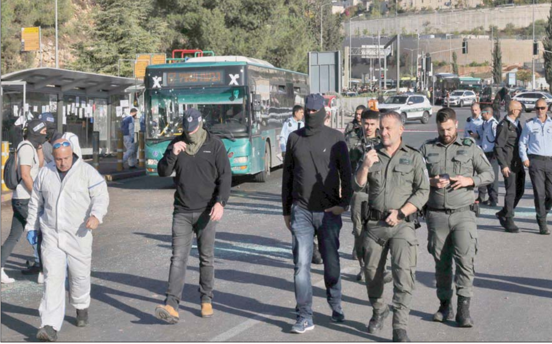
جيش وشرطة ومحققون في موقع العملية