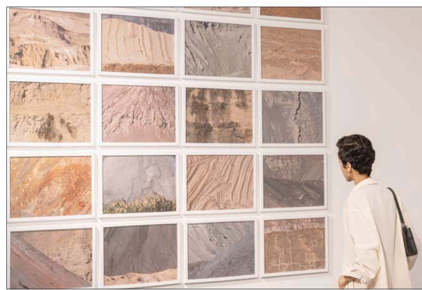
تغيرات الجيولوجيا السعودية تنطق بصورة فنية