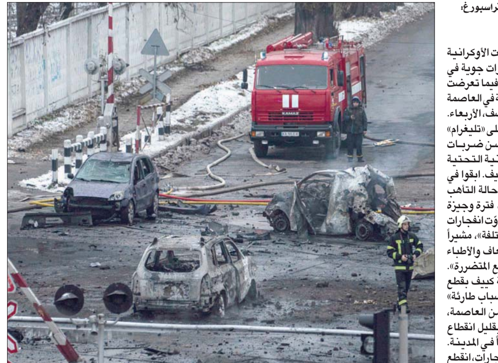
أعلنت الإدارة العسكرية في كييف مقتل ما لا يقل عن ثلاثة أشخاص وإصابة ستة جراء الضربات (أ.ب.)

فولوديمير زيلينسكي الولايات المتحدة وولاً أخرى على إعلان روسيا دولة راعية للإرهاب، متهماً قواتها باستهداف المدنيين، وهو ما تنفيه موسكو. ورفض وزير الخارجية الأميركي أنتوني بلينكن حتى الآن إدراج روسيا في تلك القائمة على الرغم من صدور قرارات من مجلسي الكونغرس تحته على ذلك. وتشمل قائمة وزارة الخارجية الأميركية حالياً للدول الراقية للإرهاب أربع دول هي: كوريا الشمالية وإيران وسوريا، مما يعني حظر الصادرات الدفاعية، وفرض قيود مالية. ومن بين دول الاتحاد الأوروبي، أقرت برلمانات أربع دول المسبوقة استهدفت صادرات النفط الروسية المهمة، وكبار المسؤولين. ويقول دبلوماسيون أوروبيون إن العمل جار لإعداد حزمة جديدة من العقوبات بعد أن أطلقت موسكو وإبلداً من الصواريخ والمسيرات ضد بنى تحتية للطاقة في أوكرانيا بعد تكديدها خسائر في ساحة المعركة. كما حث قرار البرلمان الأوروبي الاتحاد الأوروبي على إدراج مجموعة فاغتر العسكرية والقوات الموالية للزعيم الشيشاني رمضان كديروف على قائمة العقوبات التي تظال المنظمات «الإرهابية».