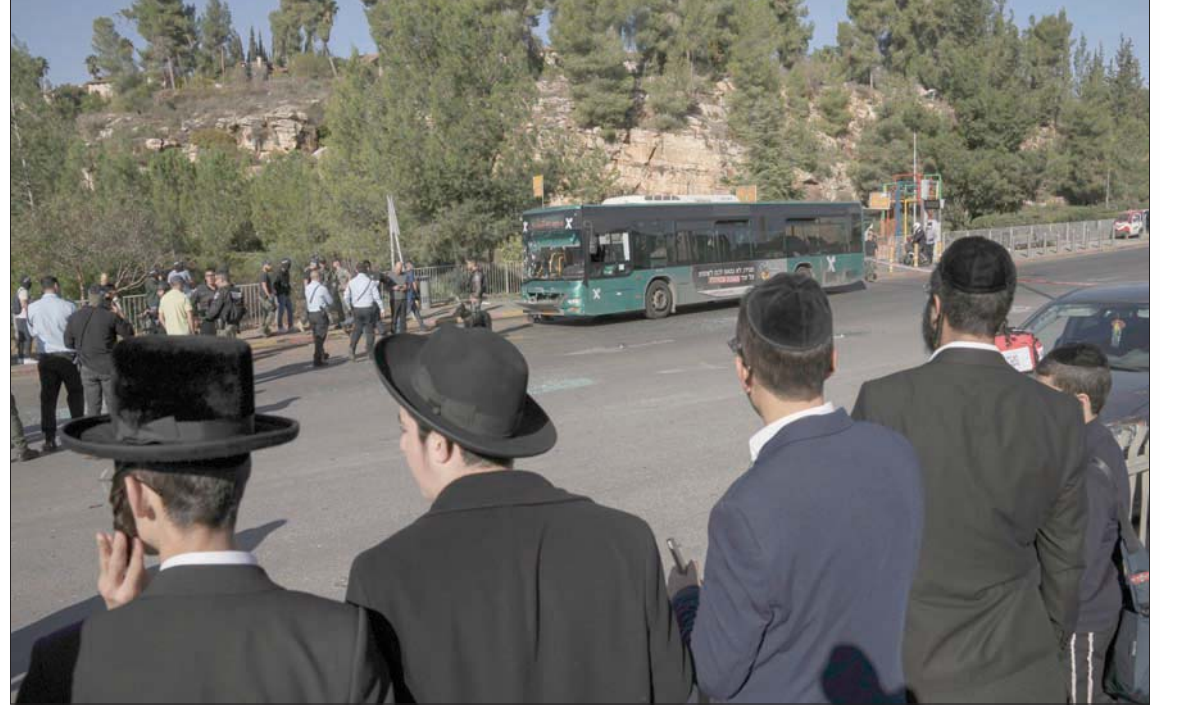
مجموعة من اليهود في موقع إحدى عمليتي القدس

مكان التفجير الأول في القدس، وتصرف كأنه «وزير الأمن الداخلي»، وتلقى إحاطة من الشرطة حول التفجير؛ في مشهد أثار انتقادات في إسرائيل. وقال بن غفير من مكان الهجوم: «تجب العودة إلى سياسة الاعتقالات». وأضاف: «يجب أن تشكل حكومة في أسرع وقت ممكن. الإرهاب لا ينتظر». وتابع: «نحتاج إلى جلب ثمن من الإرهاب، وهذا يعني العودة إلى الاعتقالات ووقف المدفوعات للسلطة... يجب أن نعطي الأسرى الحد الأدنى المطلوب بموجب القانون... لهذا السبب أريد أن أكون وزيراً للأمن الداخلي».