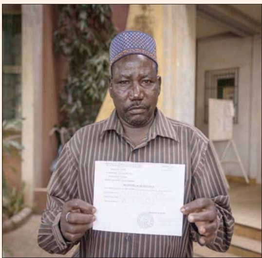
متطوع يحمل إيصلاً بأنه تسجل للدفاع عن الوطن في واغادوغو في 18 نوفمبر الحالي

قبل نحو شهر، كثف الحكم الانتقالي الجديد في بوركينافاسو استعانت بـ«متطوعين» لمساعدة الجيش في حربه المتعثرة ضد «التنظيمات الإرهابية»، التي شددت هجماتها منذ 2015، غير أن هؤلاء المتطوعين باتوا أهدافاً مكررة للمسلحين، الأمر الذي يضع شكوكاً حول جدوى المبادرة. وقتل 14 شخصاً على الأقل، بينهم ثمانية مدنيين يؤازرون الجيش، في هجومين منفصلين شنهما مسلحون شمال بوركينافاسو، بحسب ما أفادت مصادر أمنية ومحلية (الثلاثاء). ووفق «الصحافة الفرنسية» فإن «مسلحين هاجموا قرية سافي (وسط شمال) واستهدفوا متطوعي الدفاع عن الوطن الذين خسروا ثمانية من عناصرهم». كما أسفر الهجوم أيضاً عن إصابة عناصر آخرين بجروح. وأكد مصدر محلي وقوع الهجوم، مشيراً إلى أن الحصيلة هي 7 قتلى و10 جرحى بالإضافة إلى أضرار مادية جسيمة». وأضاف المصدر الأمني «قتل مسلحون ستة مدنيين قرب ماركوي (شمال شرق) ونهبوا سيارات وممتلكات أخرى». وقال أحد سكان المنطقة ممن قتل قريب له في الهجوم ماركوي، «لم نثر عليهم قنابلين إلا في الأغال خلال نهار الإثنين». وأضاف أن «الإرهابيين نهبوا عدداً من الأشخاص الذين أوقفهم على الطريق وسلبوهم سياراتهم». وتكافح بوركينافاسو متسرداً عنيفاً تشنه جماعات مرتبطة بتظيمي «القاعدة» و«داعش»، بدأ في مالي المجاورة