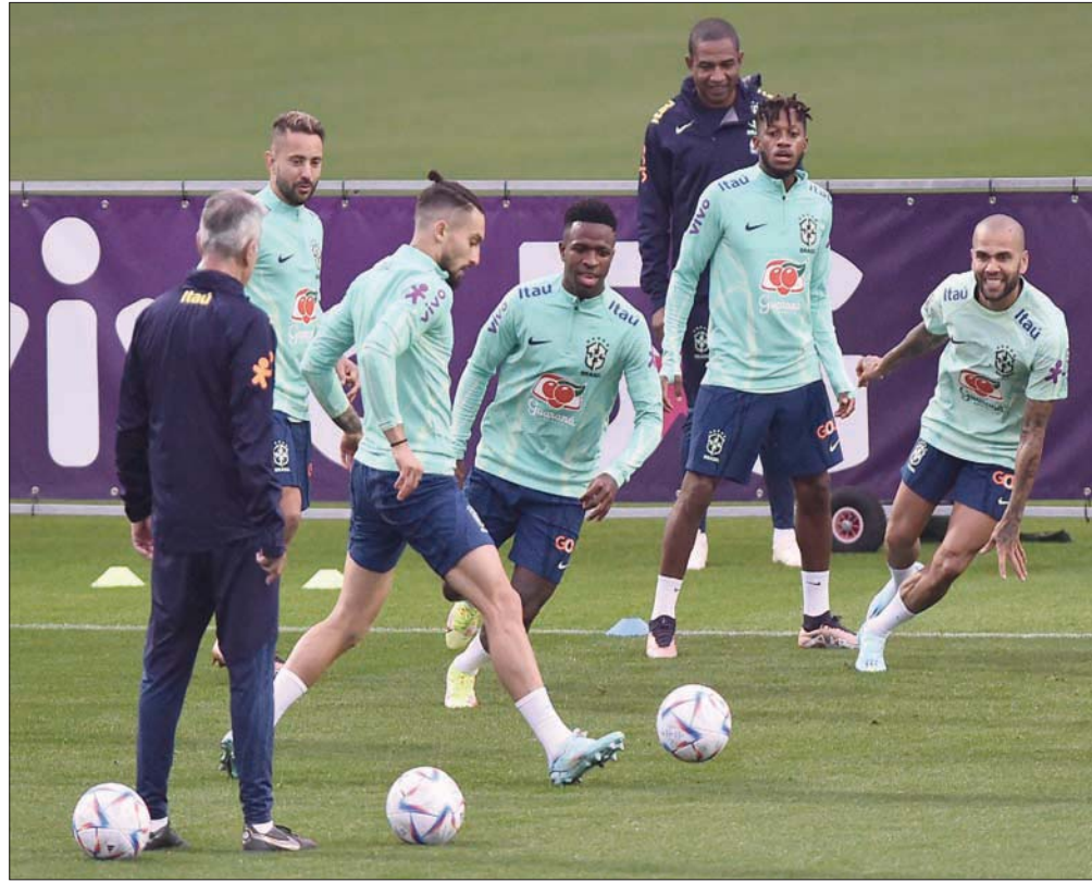
البرازيل تبدأ رحلتها نحو النجمة السادسة واللقب الأول منذ 2002 باختبار حقيقي أمام صربيا