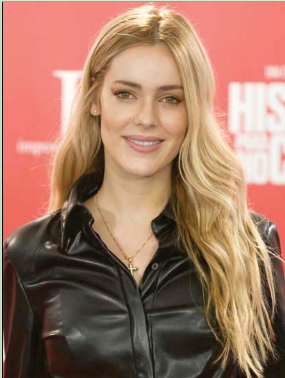
المثلة الإسبانية أليخاندرا أونيفيا لدى حضورها العرض الأول لفيلم «قصص يجب ألا تروى» في مدريد أمس (غيتي)