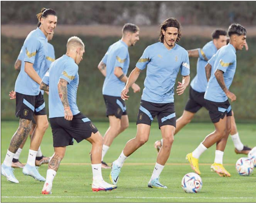
منتخب الأوروغواي يخوض التدريبات بطموحات كبيرة قبل مواجهة كوريا

وسبق للمنتخبين أن تواجهها أيضاً في دور المجموعات عام 1990 حين فازت الأوروغواي بهدف في الشوادي الأخيرة بفضل دانييل فونيسكا. وإلى جانب سواريز الهدف التاريخي للمنتخب مع 68 هدفاً، ووصيفة كافاني (58 هدفاً)، تعج التشكيلة بلاعبين يتمتعون بخبرة كبيرة مع