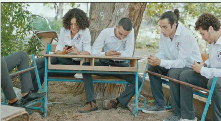
من فيلم «علم» الفائز بالذهبية

الفيلم ذاته، وعن صواب، نال جائزة «الفيدرالية الدولية لنقاد الفيلم» المعروفة باسم «فيبريسي».