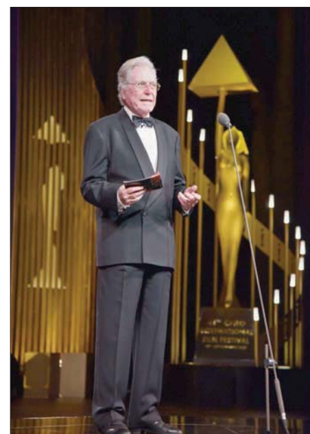
الفنان حسين فهمي يلقي كلمته في حفل الافتتاح