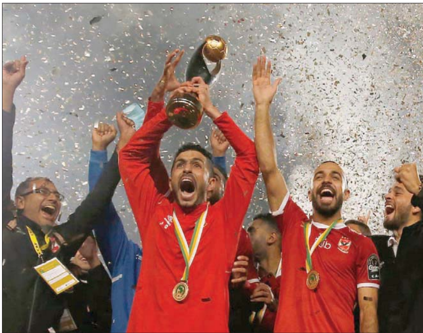
الأهلي المصري، صاحب الرقم القياسي في عدد مرات الفوز بالبطولة (10 ألقاب)

التنزاني. المستوى الرابع: فاينرز، والقطن، والمريخ، وفيثا كلوب.