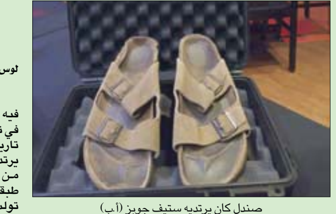
صندل كان يرتديه ستيف جوبز

تحويل المنزل الذي كان يعيش فيه «ستيف جوبز» عندما شارك في تأسيس شركة «أبل» إلى موقع تاريخي، كما جرى بيع صندل كان يرتديه داخل المنزل مقابل ما يقرب من 220,000 جنيه إسترليني، طبقاً لما أعلنته دار المزادات التي تولت أمر البيع.