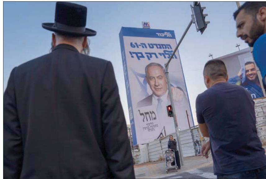
ملصق لنتنياهو في تل أبيب

الأمير، ويتجه لتعيين أشخاص ذوي خبرة في المنصبين الأكثر حساسية من الناحية الأمنية». ويبدو أن الضغط الأمريكي يؤتي ثماره على نتنياهو، لكنه لا يلقى أذناً صاغية عند سموتريتش وابن غير. وقال مصدر في حزب «ليكود» الذي يرأسه نتنياهو، إنه يفكر بتعيين رئيس حزب «شاس»، أرييه درعي، وزير الدفاع بدل المالية التي يطلب بها، من أجل إقصاء سموتريتش