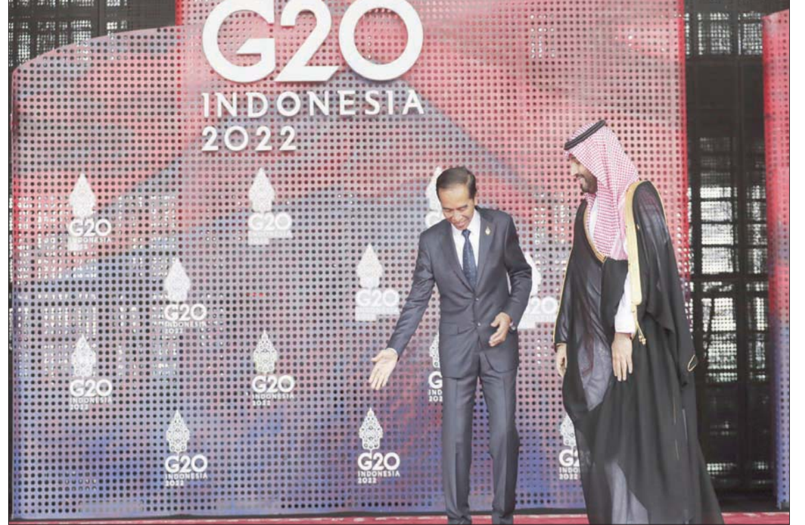
الرئيس الإندونيسي مرحباً بولي العهد السعودي في القمة أمس

سياساته الرامية لمواجهة التضخم. ولفت مسؤول أمريكي كبير، أمس (الثلاثاء)، إلى أن بلاده تسعى إلى إقناع الصين والأعضاء الآخرين في مجموعة العشرين ببذل مزيد من الجهد لتخفيف ديون أفقر الدول. وسيتخاطب المشاركون في البيان الختامي للقمة المنعقدة حتى الأربعاء، مشيراً إلى أن بلداً واحداً «يعارض» اعتبارها سياسة الرامية لمواجهة التضخم. وتتركز جميع الأنظار على الصين التي تقرب رئيسها شي جينبينغ من الرئيس الروسي فلاديمير بوتين شتية الحرب، بحيث شكلاً جبهة مشتركة ضد ما يعتبرها مساعي الهيمنة الغربية.