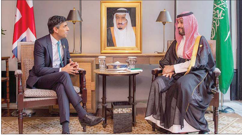
ولي العهد السعودي خلال لقائه رئيس الوزراء البريطاني في بالي