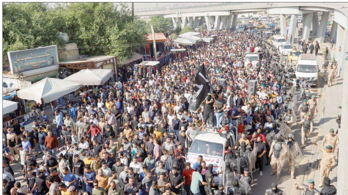
احتجاج لمقاولين عراقيين مؤقتين يسعون للحصول على وظائف دائمة في بغداد

موقع World Review الأميركي، في تقرير له، إن «العراق جاء بالمرتبة الخامسة كأكبر منتج للنفط عالمياً، بمعدل 4,260 مليون برميل يومياً بعد كل من الولايات المتحدة التي جاءت أولاً بمعدل 11,567 مليون برميل يومياً، وجاءت روسيا ثانياً بمعدل 10,503 مليون برميل يومياً، وتم نيل جاءت السعودية ثالثاً بمعدل 10,225 مليون برميل يومياً، وجاءت كندا رابعاً بمعدل 4,665 مليون برميل يومياً». وفي ظل هذه التركة التي تراكمت طوال 19 عاماً بسبب المشكلات البنوية في النظام السياسي في العراق الذي قام على أساس المحاصصة العرقية والطائفية والحزبية، يصل رئيس الوزراء العراقي الجديد محمد شياع السوداني للبليل بالنهار من أجل البحث عن حلول عاجلة ومتوسطة وطويلة الأمد لهذه الأزمات المترابطة، في وقت لا يستعد المراقبون اصطفاً في