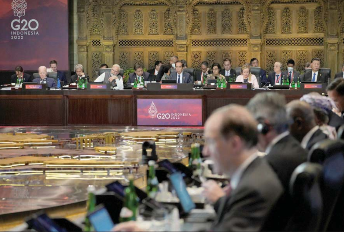
الرئيس الإندونيسي يتحدث أمام القادة في اليوم الأول من قمة العشرين أمس