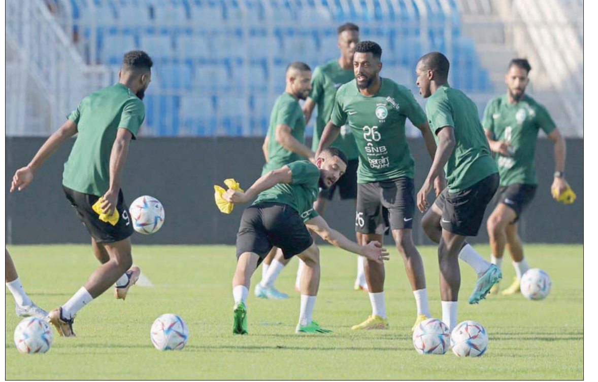
الأخضر أجرى تدريباته صباحاً في الأيام الماضية

عبد الله عطيف وعبد الإله المالكي ورياض شراحيلى وعلي الحسن وسلمان الفرج ومحمد كنعو وناصر الدوسري وسامي النجعي وهتان باهيري وعبد الرحمن العبود ونواف العابد الثنائي فراس البريكان وصالح الشهري. يشار إلى أن «الأخضر» يحضر في المجموعة الثالثة بجوار منتخبات الأرجنتين والمكسيك وبولندا، حيث يفتتح مشواره في البطولة بملاقاة الأرجنتين يوم 22 على استاد «الوسيل»، ثم يلاقي بولندا في استاد «المدينة التعليمية» يوم 26 نوفمبر، على أن يختم مبارياته في دور المجموعات بمواجهة المكسيك على استاد «الوسيل».