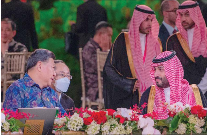
ولي العهد السعودي والرئيس الصيني خلال حفل عشاء بالمنتجع الذي تعقد فيه القمة