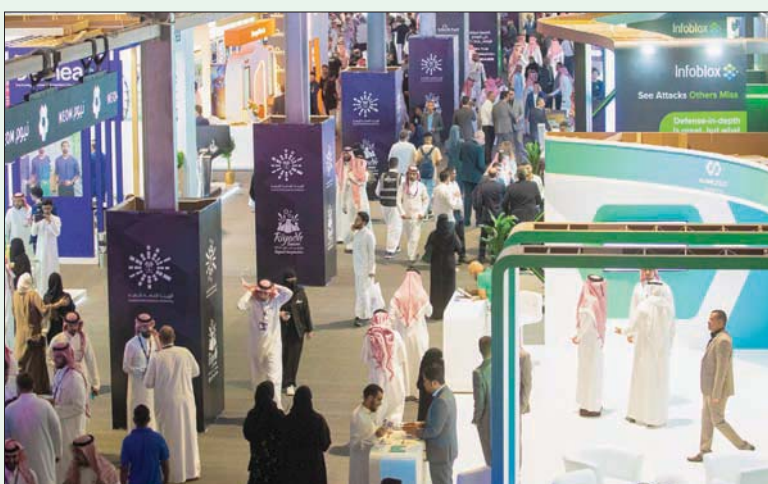
فعالية «بلاك هات» تهدف إلى خلق منصة للحوار بين المهتمين في القطاع

يذكر، أن «بلاك هات» هي فعالية عالمية متخصصة في الأمن السيبراني انطلقت في عام 1997، وتعد إحدى أهم المحافل العالمية لقطاع أمن المعلومات وقبلة للمهتمين فيه، وبدأت كفعالية سنوية تقام في لاس فيغاس قبل أن تنتقل للمدينة من دول العالم، وتأتي الفعالية لأول مرة في المنطقة هذا العام في الرياض؛ لاستعراض آخر الخبرات والتجارب، كما تضم منطقة لورش العمل التقنية، وقاعة للأعمال تجمع الشركات الكبرى