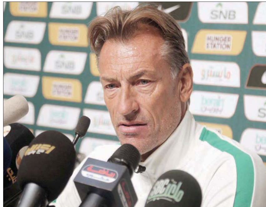
رينارد خلال المؤتمر الصحافي أمس

الرياض: فارس الفزي اعتبر الفرنسي إيرفي رينارد مدرب المنتخب السعودي المواجهة الودية التي ستجمع الأخضر بنظيره منتخب كرواتيا مساء الأربعاء قوية كونها تجمع بوضوح موندريال النسخة السابقة. وأكد رينارد، جاهزية اللاعبين سلمان الفرج لمباراة كرواتيا، مشيراً إلى أن اللاعب في أتم جاهزية للعب 90 دقيقة في المباريات المقبلة. وطالب رينارد الجماهير السعودية بالثقة في اللاعبين الذين يعرفونهم جيداً، لافتاً إلى أن الدوافع في المباريات التجريبية تختلف عن الرسمية. ويتأهب المنتخبان لبدء مشوارهما في موندريال كأس العالم وذلك بمواجهة ودية أخيرة قبل المغادرة إلى العاصمة القطرية الدوحة تحضيراً للبطولة التي ستنتقل الأحد المقبل. وقال رينارد في المؤتمر الصحافي الذي أقيم في ملعب الأمير فيصل بن فهد بالعاصمة الرياض: «هذه مباراتنا الأخيرة قبل سبعة أيام من مواجهتنا الأولى في الموندريال»، مضيفاً: «للملعب أمام كرواتيا يُعد خياراً جيداً قبل الموندريال فلدريهم مدرب رائع». وواصل رينارد حديثه عن منتخب كرواتيا: «هو أحد المرشحين لتحقيق كأس العالم، فقد وصلوا إلى نهائي النسخة الماضية ولديهم لاعبين رائعون، ومدريهم أحترمهم كثيراً فهو يقود المنتخب منذ 2017». وأشار رينارد إلى اختلاف المباريات الرسمية والودية، موضحاً: «في مسيرتي التدريبية لعبت مواجهات ودية كثيرة لكن الأهم هي المباريات الرسمية، دائماً عن المباريات الرسمية، لأن