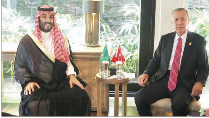
ولي العهد السعودي لدى اجتماعه مع الرئيس التركي خلال القمة أمس (أغب)

بالي، «الشرق الأوسط» رأس الأمير محمد بن سلمان بن عبد العزيز ولي العهد رئيس مجلس الوزراء السعودي وفد المملكة في قمة قادة دول مجموعة العشرين، القمة التي بدأت أمس أعمالها في مدينة بالي بإندونيسيا، وكان في استقباله لدى وصوله إلى مقر انعقاد القمة الرئيس الإندونيسي جوكو ويدودو. محمد بن سلمان بن عبد العزيز ولي العهد السعودي، سلسلة لقاءات في مدينة بالي مع عدد من قادة الدول المشاركين والشخصيات المشاركة في قمة دول العشرين، حيث التقى، علا على حدة، رئيس دولة الإمارات العربية المتحدة الشيخ محمد بن زايد آل نهيان، والرئيس التركي رجب طيب إردوغان، ورئيس الوزراء البريطاني ريشي سوناك، والمندوب العامة صندوق النقد الدولي كريستالينا غورغيفا. وتناولت اللقاءات الموضوعات المشتركة، وفاق التعاون في شتى المجالات، إلى جانب بحث المستجدات والتطورات الإقليمية والدولية والجهود المبذولة تجاهها. وكان الأمير محمد بن سلمان ولي العهد، وصل في وقت سابق إلى إندونيسيا