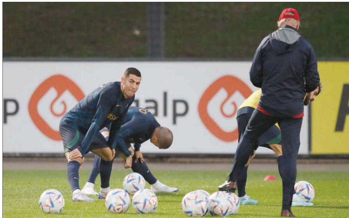
رونالدو خلال تدريبات المنتخب البرتغالي استعداداً لمونديال قطر

في الدوري الإنجليزي ودوري أبطال أوروبا عام 2008 بالإضافة إلى جائزة الكرة الذهبية الأولى له في ذلك العام،