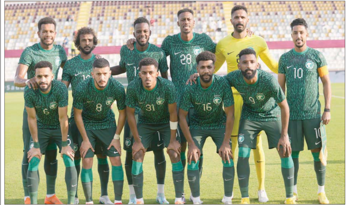
المنتخب السعودي يطمح لإنجاز في مونديال قطر عبر مجموعة صعبة

الخاصة، ويأمل مشجعوه أن يستمتع للنصيحة. ويحتاج ديشامب، الطامح للفوز بكأس لاعبا ومدربا للمرة الثالثة، ليعادل البرازيلي ماريو زاغالو الذي رفع الكأس مرتين كلاعب ومرة واحدة كمدرّب، إلى كتيبة مثالية خالية من الإصابات لتحقيق هدفه.