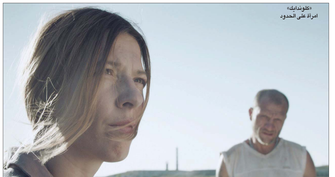
«كلوندايك» امرأة على الحدود

الذين سارعوا لانتقاد إسناد مهمة رئاسة المهرجان للممثل حسين فهمي على أساس توقعاتهم بأن ليس كل ممثل جيد بالضرورة سيكون مسؤولاً سينمائياً صالحاً المهمة كهذه، أخطأوا في حكمهم المسبق هذا. فالرجل لم يكن ليصل لهذه المكانة دون ثقافة سينمائية كبيرة. التمثيل كان التعبير عن حبه للسينما وهذا الحب لا يمكن أن يتجزأ، بل هو أيل للتطور دوماً.