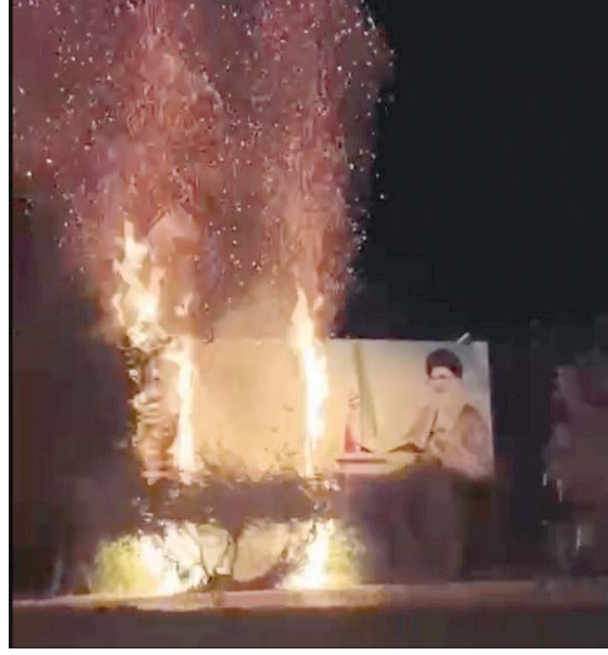
صورة من فيديو يظهر اشتعال لوحة عملاقة تحمل صورة خامنئي (تويتر)

وأظهر مقطع فيديو لشراع في منطقة شهرك غرب في غرب طهران، أشخاصاً يهتفون في الشارع بعد سماع دوي عدة طلقات، وكان بازار العاصمة طهران 10 نقاط في دخول الاحتجاجات الحالية شهرها الثاني. وحلقت مروحيات فوق تبريز