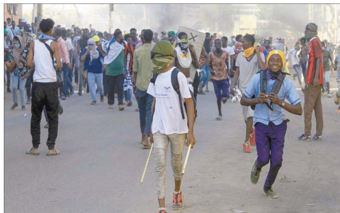
جانب من الاحتجاجات في الخرطوم للمطالبة بالحكم المدني 8 نوفمبر