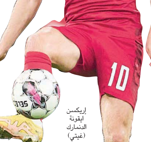
إريكسن أيقونة الدنمارك

وتعمل تونس على مجموعة كبيرة من أصحاب الخبرة أبرزهم وهي الخرزى (31 عاماً) لاعب موندياليه الفرنسي، ويوسف المساهني المحترف بالدوري القطري. وتخشو فرنسا نهائيات قطر في أجواء تشكيك