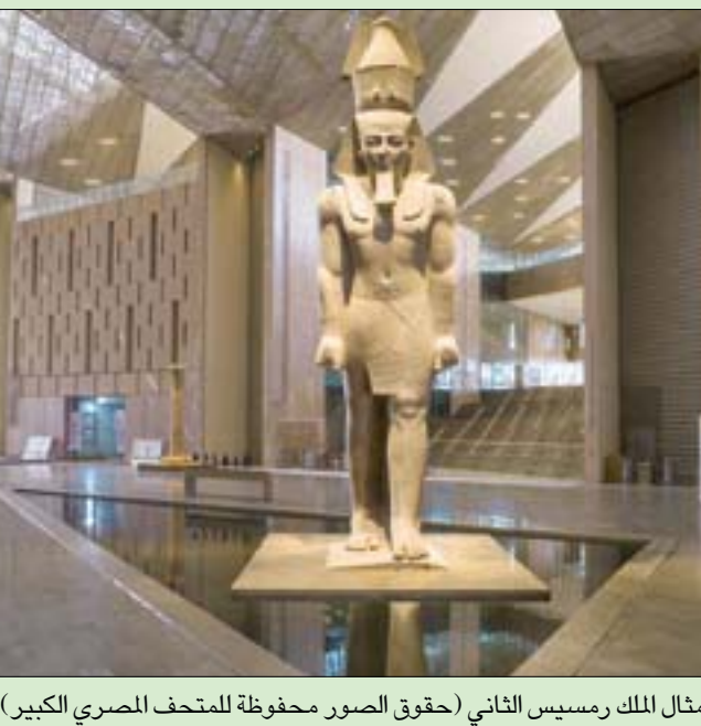
تمثال الملك رمسيس الثاني

بالإضافة إلى مركز لترميم الآثار، مزود بأحدث التقنيات العلمية. ويشتمل المتحف أيضاً على مكاتب، ومسرح كبير، وقاعة مؤتمرات، ومنطقة للأنشطة التجارية، ومطاعم فاخرة. أما الجزء الخارجي من المتحف فيشتمل على مجموعة من الحدائق من بينها حديقة المنحوتات وحديقة النخيل، والحديقة المدرجة ذات التصميم الفريد. ووفق بيان إدارة المتحف، فإنه سوف يفتح جزئياً لاستقبال مجموعة من الزيارات الجماعية، محدودة العدد، ولإقامة بعض الفعاليات الخاصة التي يتم اختيارها بعناية. حيث سيتمكن الزوار خلال هذه المرحلة من زيارة بعض أقسام المتحف منها: ميدان المسلة المعلقة، والصالة الرئيسية المعروفة باسم البهو العظيم، ومتحف الأطفال، وتجربة الواقع الافتراضي، والحدائق، والمطاعم، والمقاهي، والمحلات التي تشمل علامات تجارية مصرية رائدة. كما سيتمكن الزوار عند دخولهم صالة الاستقبال الرئيسية في المتحف المصري الكبير، من رؤية العديد من الآثار الفريدة مثل: تمثال رمسيس الثاني، والتمائيل العشرة للملك سنوسرت، ولوحة «قائمة ملوك سفارة» الشهيرة، وعمود النصر لمرنبتاح، بالإضافة إلى تمثالين من ملوك العصر البطلمي. وشدد بيان المتحف على أن «باقي أقسام ومناطق المتحف المصري الكبير الداخلية الأخرى ستظل مغلقة وهي القاعة الرئيسية، وقاعة توت عنخ آمون؛ منتحاً للأطفال، ومساحة المرتقب».