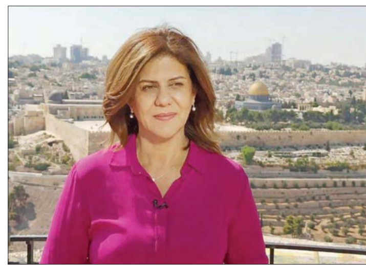
الزميلة الراحلة شيرين أبو عاقلة (أ.ب)

وأضافت أن السلطات الأميركية تتحمل مسؤولية إجراء تحقيق «عندما يُقتل مواطن أميركي في الخارج، خصوصاً عندما تتم عملية القتل بأيدي جيش أجنبي، كما هو الحال بالنسبة لشيرين».