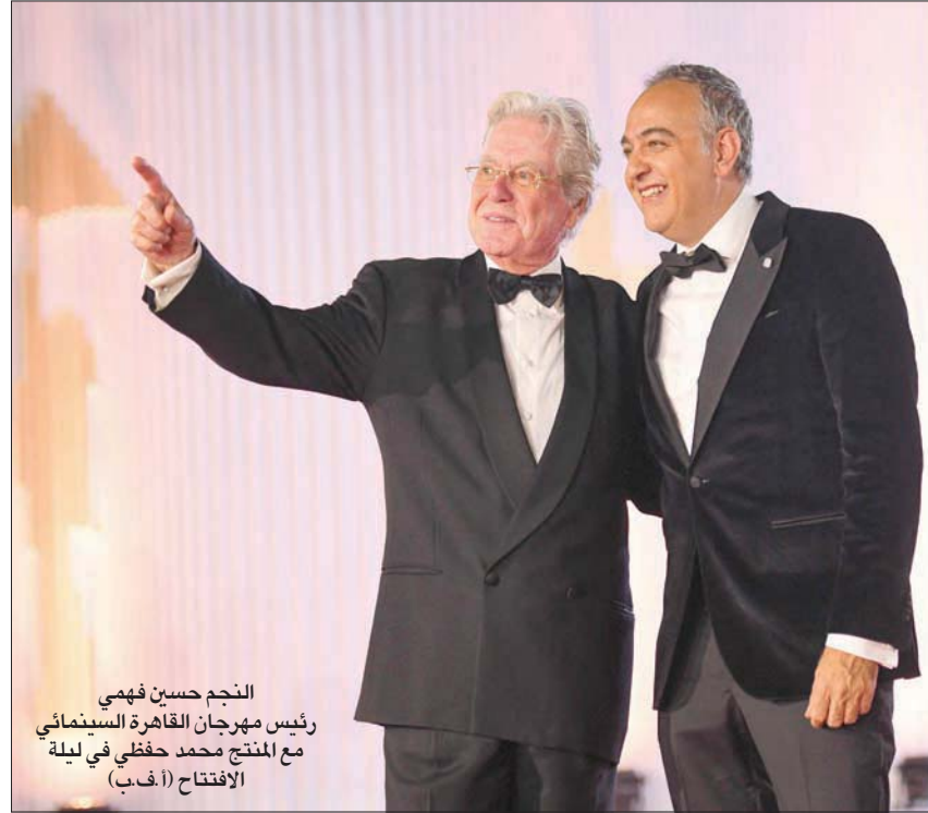
النجم حسين فهمي رئيس مهرجان القاهرة السينمائي مع المنتج محمد حفظي في ليلة الافتتاح

ومهرجان أصغر حجماً من كل ما سبق من هذه المزايا يُقام في مدينة لوس أنجلوس ويتخصص بعرض الأفلام القادمة من آسيا. الفارق ليس فقط بالحجم بل كذلك بالاختصاص، لكن المهرجانين يلتقيان عند نقطة واحدة: حب العطاء في سبيل إلتقان الجهد المبذول، أفلام مهرجان آسيا وصلحتي جميعاً، وبذلك أتابع في الواقع مهرجانين معاً. الأول في صالات السينما الموزعة في دار الأوبرا في الزمالك، والآخر على