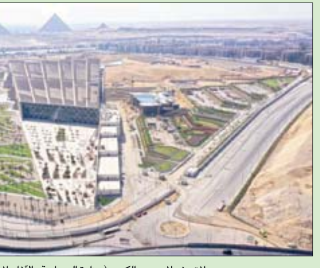
المتحف المصري الكبير (وزارة السياحة والآثار المصرية)

هذا المكان يبدأ الزوار رحلتهم لاستكشاف التاريخ المصري العريق، عبر آلاف القطع الأثرية الفريدة. كما سيشاهد زوار المتحف المصرية الكاملة لأثار وكثرون الملك توت عنخ آمون، في مكان واحد لأول مرة منذ اكتشاف مقبرته الشهيرة. كما يضم المتحف المصري الكبير مجموعة من الآثار الفريدة مثل: تمثال رمسيس الثاني، والتمائيل العشرة للملك سنوسرت، ولوحة «قائمة ملوك سفارة» الشهيرة، وعمود النصر لمرنبتاح، بالإضافة إلى تمثالين من ملوك العصر البطلمي. وشدد بيان المتحف على أن «باقي أقسام ومناطق المتحف المصري الكبير الداخلية الأخرى ستظل مغلقة وهي القاعة الرئيسية، وقاعة توت عنخ آمون؛ منتحاً للأطفال، ومساحة المرتقب».