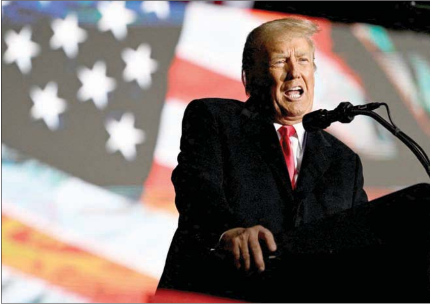
ترمب يخطب في تجمع انتخابي دعماً لمرشحين جمهوريين في السابع من نوفمبر الحالي (رويترز)

ولم تقتصر الانتقادات عند هذا الحد، بل توسعت لتشمل نائب ترمب السابق مايك بنس الذي قال لدى سؤاله على شبكة «إي بي سي» ما إذا كان يعتقد أن ترمب يجب أن يكون رئيساً مجدداً: «هذا أمر يعود للشعب الأميركي، لكنني أعتقد أنه لدينا خيارات أفضل للمستقبل»، خيارات، قد تشمل بنس الذي يدرس ترشيحه هو كذلك للرئاسة، فقال لدى سؤاله عن خطته المستقبلية: «نحن ننظر في الموضوع في العائلة».