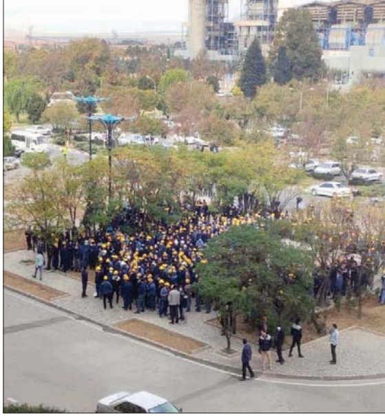
إضرابات في مصنع أصفهان للحديد

بدورها، أشارت منظمة «هتغوا» الكردية لحقوق الإنسان إلى حدوث إضرابات جماعية في المدن التي يقطنها غالبية من الأكراد في شمال وشمال غربي إيران. كما أصرت جامعات في هذه المناطق، وأشارت إلى إضرابات في مدن بوكان وديواندره ومریان وسنندج وتحولت المسيرات الاحتجاجية