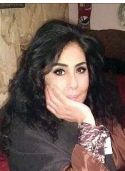
خيرات الزين في المقهى الخاص بها