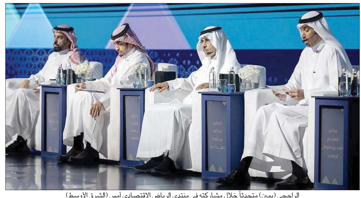
الراجحي (يمين) متحدثاً خلال مشاركته في منتدى الرياض الاقتصادي أمس