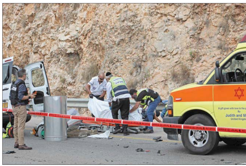
الموقع الذي سقط فيه المهاجم الفلسطيني (أ.ب)

وخلافاً لخدمة الإسعاف الإسرائيلية، إن حارس الأمن (36 عاماً) أصيب بجراح خطيرة، وأن رجلاً آخر تعرض للطنع بالقرب من مدخل المنطقة الصناعية في حالة حرجة، بينما قتل رجلان في