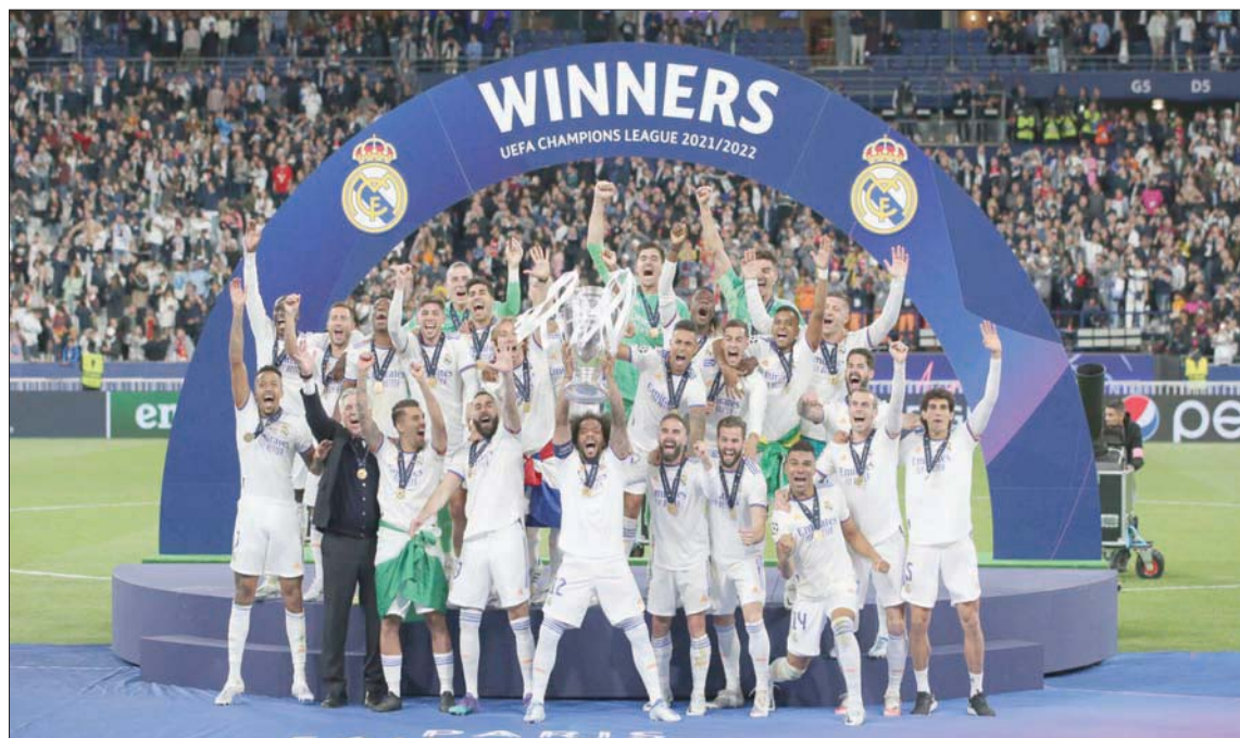
ريال مدريد ولقب دوري الأبطال الموسم الماضي بعد الفوز على ليفربول

إيطاليا وإنجلترا وجورجيا في التاهل لكأس العالم، سيكون لدى نابولي عدد كبير من اللاعبين الذين لن يشاركون في المونديال وسيحصلون على فترة كبيرة من الراحة، وهو الأمر الذي سيجعلهم يستعيدون نشاطهم بمجرد عودة المنافسات المحلية والقرارية. وفي المقابل، فإن فريق إنترناشونال فرانكفورت لا يقدم كرة قدم ممتعة تحت قيادة المدير الفني أوليفر غلاسر، لكنه أصبح مقترساً ولديه خبرات كبيرة في المباريات التي يلعبها خارج ملعبه بالمسابقات الأوروبية. الفائز: نابولي.