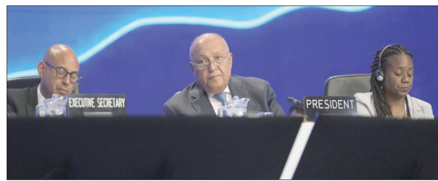
جانبا من فعاليات الشق الثاني رفيع المستوى من مؤتمر المناخ

تحدثت فياسمي ناعومي ماتافا، رئيسة وزراء جزيرة ساموا، عن التحديات المناخية التي تواجهها بلادها، وغيرها من الدول الجزرية الصغيرة، وقالت إنها «فعلت الألف الأميال» عبرت محيطات لتشارك في مؤتمر المناخ، مشائلة حول ما إذا