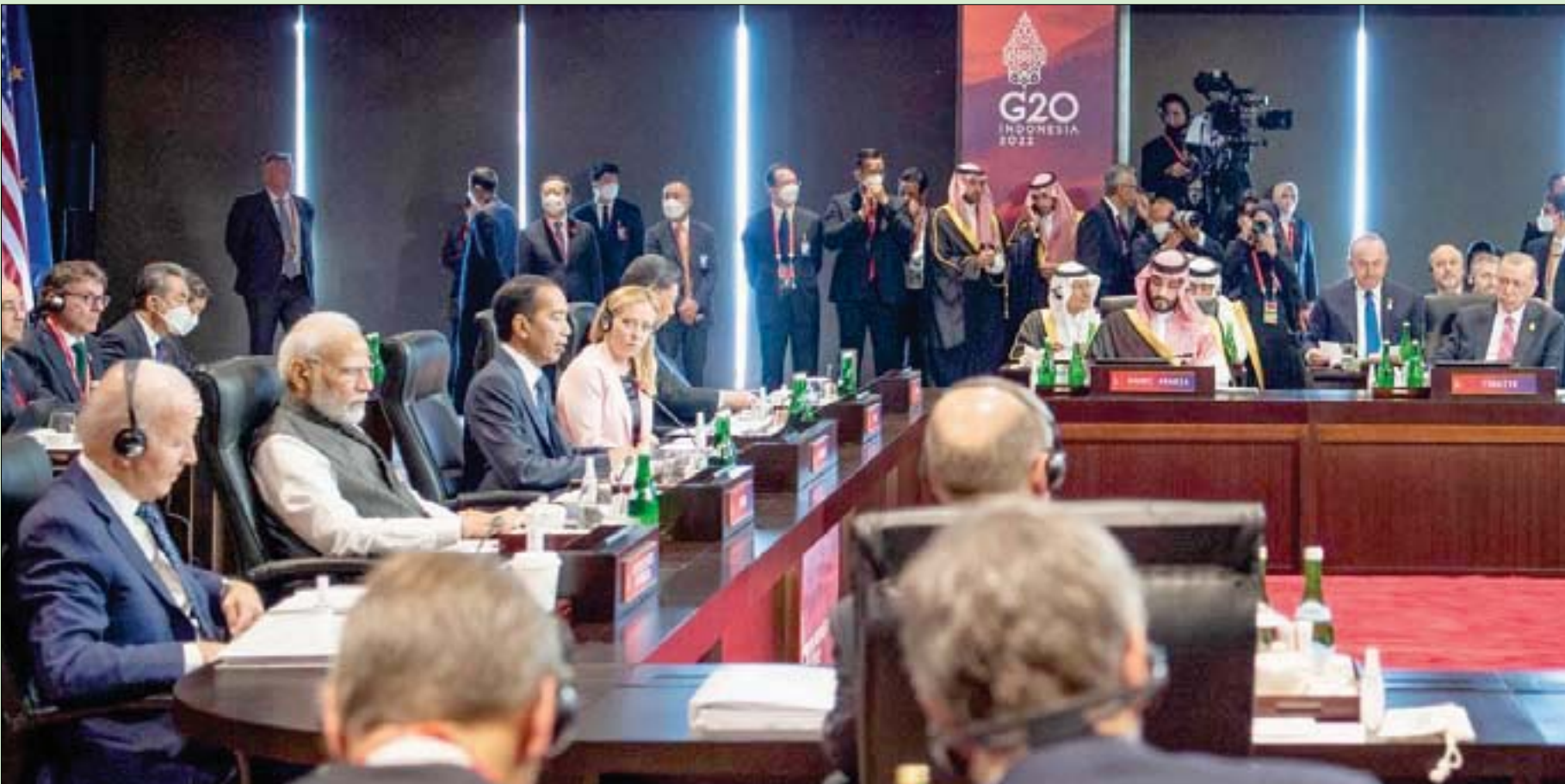
جانب من اجتماع القادة المشاركين في قمة مجموعة العشرين في بالي أمس وبدا ولي العهد السعودي الأمير محمد بن سلمان

بالي، تجلاء حبريري انطلقت أعمال قمة «مجموعة العشرين» في جزيرة بالي الإندونيسية وسط انقسامات بشأن الحرب الدائرة في أوكرانيا. وضغوط مارسها الدول الداعمة لكيف على موسكو لوقف الحرب. وفي المقابل، حظيت غالبية القضايا التي يحثها القمة بدعم الدول الأعضاء، على غرار التوافق على خطورة أزمة الغذاء ومواجهة تداعيات التضخم. وترأس ولي العهد السعودي الأمير محمد بن سلمان وفد بلاده في القمة، حيث أجرى لقاءات مع عدد من قادة العالم من ضمنهم الرئيس الإماراتي محمد بن زايد والتركي رجب طيب أردوغان ورئيس الوزراء البريطاني ريشي سوناك. واتفق أعضاء «مجموعة العشرين» على مسودة بيان ختامي تتحدث عن التداعيات السلبية للحرب في أوكرانيا، متناولة مصطلح «الحرب» الذي ترفضه موسكو التي تراها «عملية عسكرية خاصة». ونشر الوثيقة إلى أن معظم الأعضاء... يدينون بشدة النزاع، معتبرين استخدام السلاح النووي أو التهديد به «غير مقبول». مع الدعوة إلى تصديق اتفاقية تصدير الحبوب، علماً بأن هذه الاتفاقية ستنتهي السبت المقبل. ورفضت روسيا ممثلة بوزير خارجيتها سيرغي لافروف «محاولات مسيئة» للبيان الختامي. وغادر لافروف اجتماعات اليوم الأول مبكراً، ما يعكس صعوبة المفاوضات التي شهدتها كواليس المنعقد الذي تعقد فيه القمة. وفي خضم هذه الخلافات، تتجه الأنظار إلى الصين التي يبدو أن رئيسها شي جينبينغ