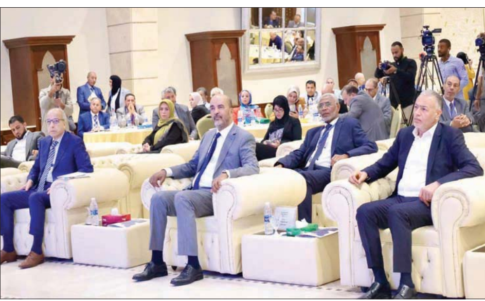
موسى الكوني خلال مشاركته في مؤتمر «مكافحة الفساد لتدعيم الاستقرار» (المكتب الإعلامي للمجلس)

وسبق له «تبار بالتريس» تنظيم مظاهرات في مناطق ليبية عدة، للمطالبة بإسقاط جميع الأجسام السياسية الحاكمة في البلاد، لكنه انتهى إلى لا شيء. كما أعلن مطلع يوليو (تموز) الماضي، الدخول في حالة عصيان مدني في المدن المختلفة عقب فشل محادثات حينها مع «المجلس الرئاسي»، مشيرين إلى أن الغني، لإنعاقه بالتدخل لإنهاء الأزمة السياسية الراهنة في البلاد.