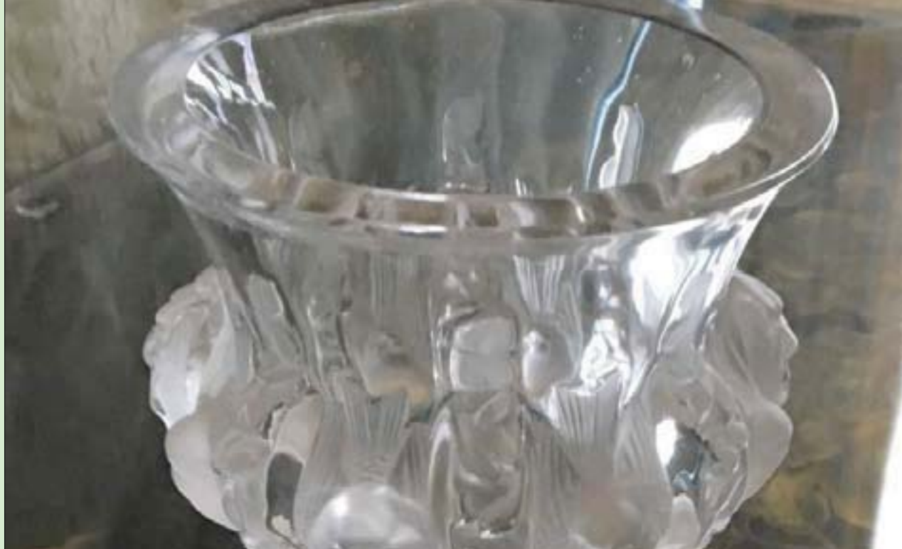
الإناء العتيق (شرطة كينت)

لندن، «الشرق الأوسط» كنز أن الإناء شرق في أثناء عرضه للزوار بين الخميس 10 نوفمبر (تشرين الثاني) والاثنيين 14 نوفمبر. والجدير بالذكر أن ريني لايك أنشأ منذ أكثر من قرن مضى دار «لاليك» الفرنسية عام 1888. ووصفت منتجات «لاليك» بأنها «الرمز الأكبر للرفاهية الفرنسية»، وتشتهر الدار بمنتجات فن الزجاج الرفيع، بما في ذلك زجاجات العطور والمزهريات خلال أوائل القرن العشرين. في ذلك الوقت تقريباً، جرى إيقاظ قلعة ليدز على يد وريثة أنغلو - أميركية، هي ليدج أوليف بيلي، التي حوّلت القصر الملكي سابقاً إلى منزل ريفي رائع لرجال الدولة البارزين وأبناء العائلات الملكية في أوروبا ونجوم السينما. قبل ذلك، جرى استخدام القلعة كمعقل نورماندي، وعاشت به 6 ملكات من القرون الوسطى، بمن في ذلك زوجة الملك هنري الثامن، كاثرين أراغون. ويعتقد مسؤولو شرطة