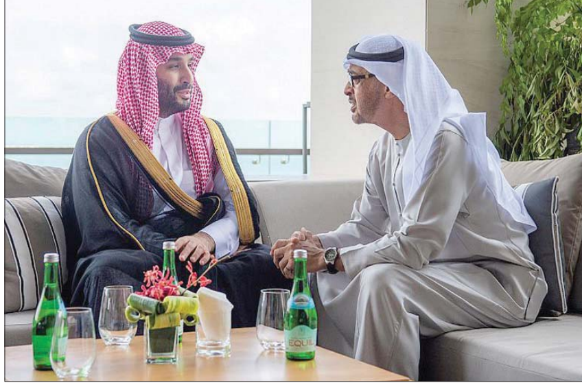
جانب من لقاء الأمير محمد بن سلمان والشيخ محمد بن زايد في بالي (واس)