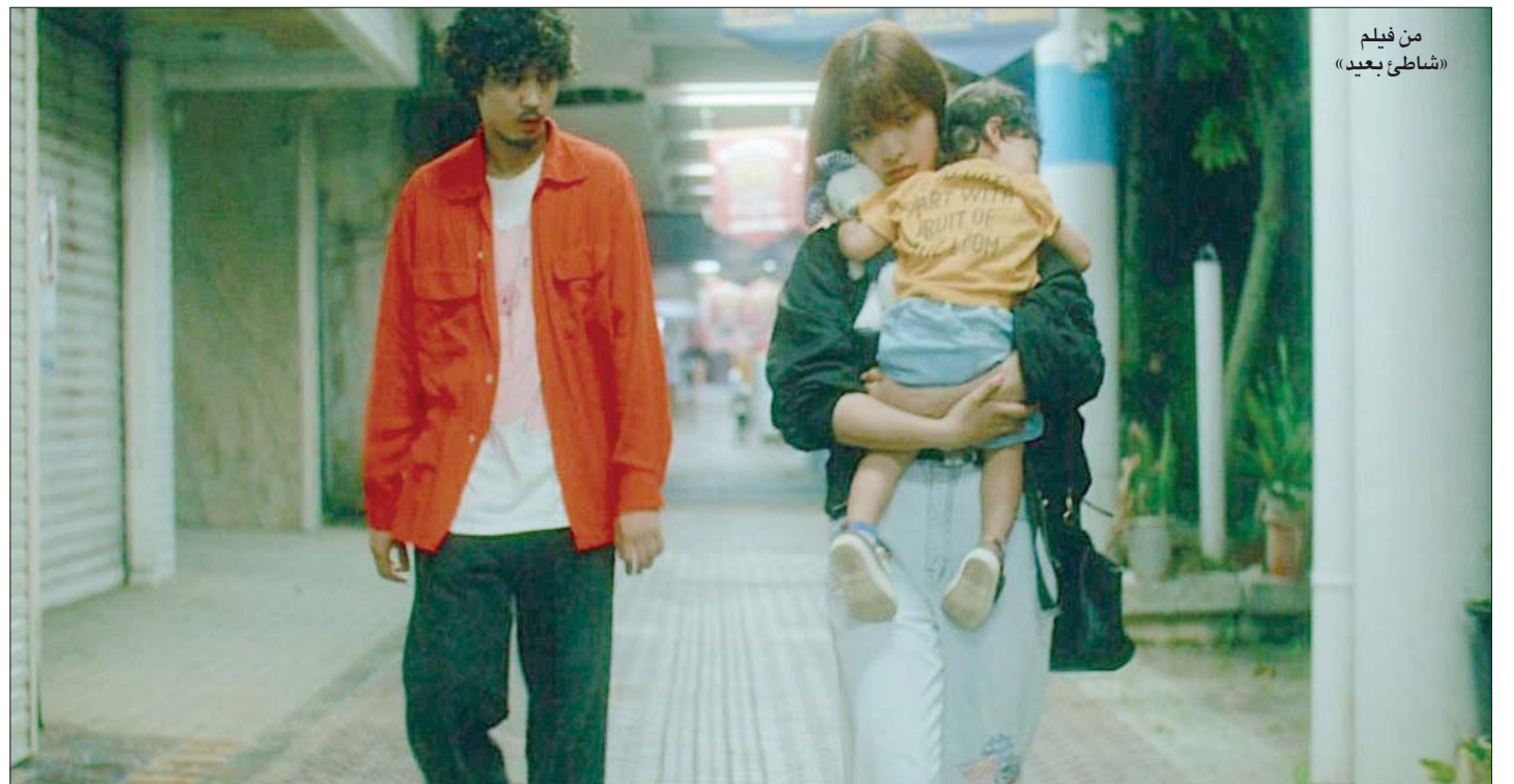
من فيلم «شاطئ بعيد»

ترقب إركا كل ما يحدث من بداية الفيلم بجاس شديد وترقب الوضع البنائس الذي تعيشه. هي المحور لفيلم تعدد مخرجه