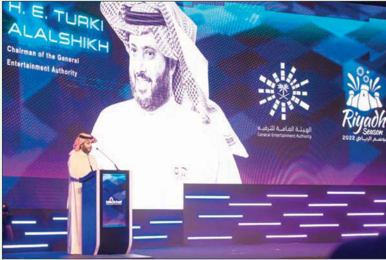
رئيس الهيئة العامة للترفيه في السعودية تركي آل الشيخ

الرياض، محمد هلال والناشطة المتخصصة بالمجال سواء العالمية منها أو المحلية، إلى جانب منطقة «أرسنال» التي يشارك فيها المطورون أحدث وسائل الاختراق مفتوحة المصدر، بالإضافة إلى الدورات التدريبية التي يقدمها 50 مدرباً محترفاً.