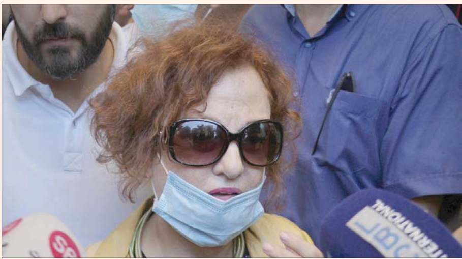
القاضية اللبنانية غادة عون

لاستجواب القاضية، إلا أن مرجعاً إلى الهيئة العامة للتمييز، يعني أن الهيئة القضائية المختصة بمحاكمة القاضية عون يجب أن يتألف من قضاة من نفس رتبته وما فوق». وقال المرجح لـ«الشرق الأوسط»، إن الإحالة «تأتي انسجاماً مع مضمون المادة 44 من قانون القضاء العدلي التي تنص على أن قضاة محاكم التمييز وأعضاء النيابة العامة لديها، ورؤساء محاكم الاستئناف والمدعين العامين لديها ورؤساء الهيئات العامة في وزارة العدل وقضاة التحقيق الأول، يحاكمون جميعاً أمام الهيئة العامة لمحكمة التمييز، سواء وقع الجرم خلال العمل أو خارجه، وسواء كان الجرم جنحة أو جنائية». وأشار إلى أن «بإقضاء القضاة يحاكمون أمام محكمة التمييز الجزائية، وفق قانون تنظيم القضاء العدلي».