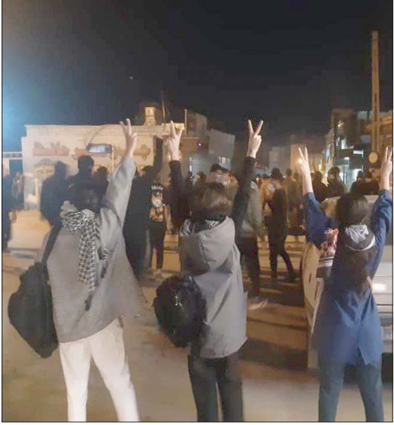
إيرانيات خلال احتجاجات في مدينة إيدج جنوب البلاد (تويتر)

وأفادت تقارير إعلامية رسمية بأن ما لا يصل إلى 19 من بين آلاف الأشخاص الذين اعتقلتهم السلطات يواجهون اتهامات عقوبتها الإعدام، في طهران ومدينة كرج القريبة منها. وذكرت وسائل إعلام إيرانية،