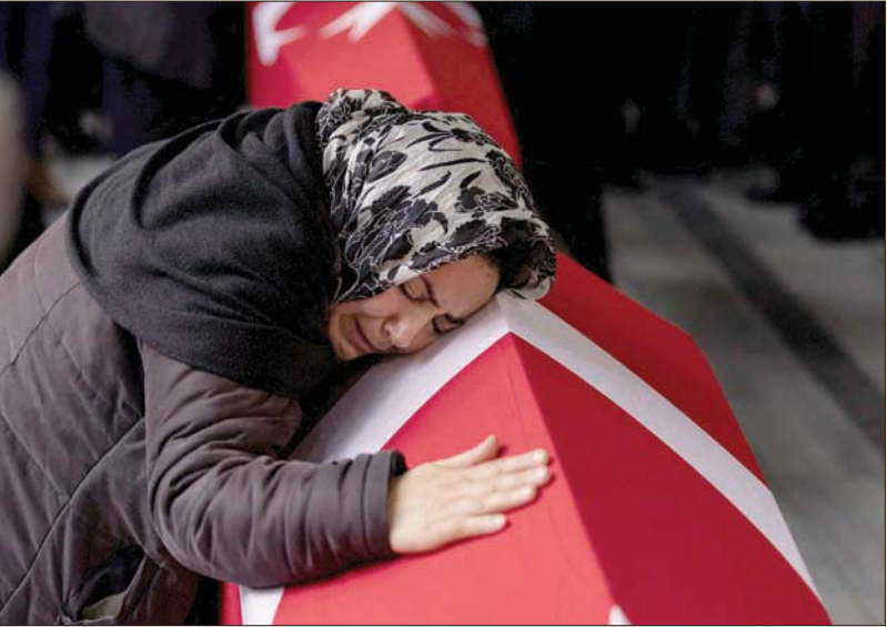
امراة تكيي إحدى ضحايا التفجير خلال التشيع في إسطنبول أمس

ثمن فعلتهم، قائلة إن الإرهابيين الذين لم يجراوا على الوقوف أمام القوات التركية في شمال سوريا والعراق، أظهروا للعالم مرات عديدة مدى دناءتهم باستهدافهم المدنيين.