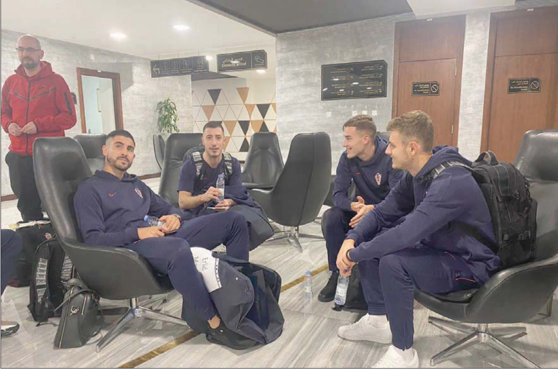
المنتخب الكرواتي وصل أمس إلى الرياض