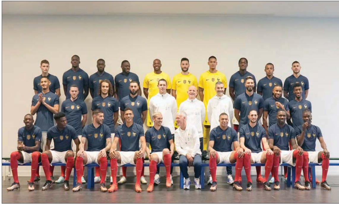
المنتخب الفرنسي توجه إلى قطر وسط شكوك حول قدرته على الحفاظ على اللقب