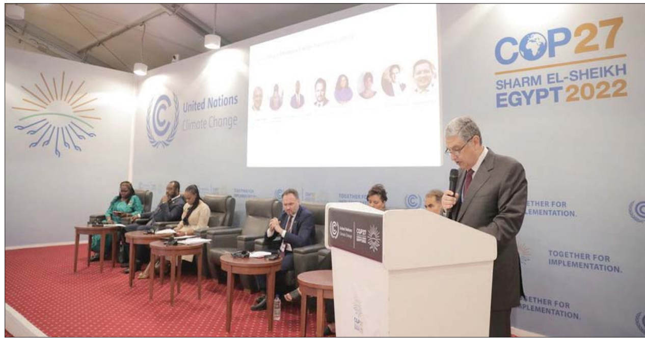
وزير الكهرباء والطاقة المصري محمد شاكر لدى إعلان المبادرة في يوم الطاقة

وأكد «الطاهر»، حرص الشركة السعودية المصرية للتعمير على تطبيق مبادئ الاستدامة في جميع مشروعات الشركة، خاصة مشروعات Central» وهو أحدث مشروعات الشركة السعودية في مصر، الذي تبلغ تكلفته الاستثمارية حوالي 13 مليار جنيه.