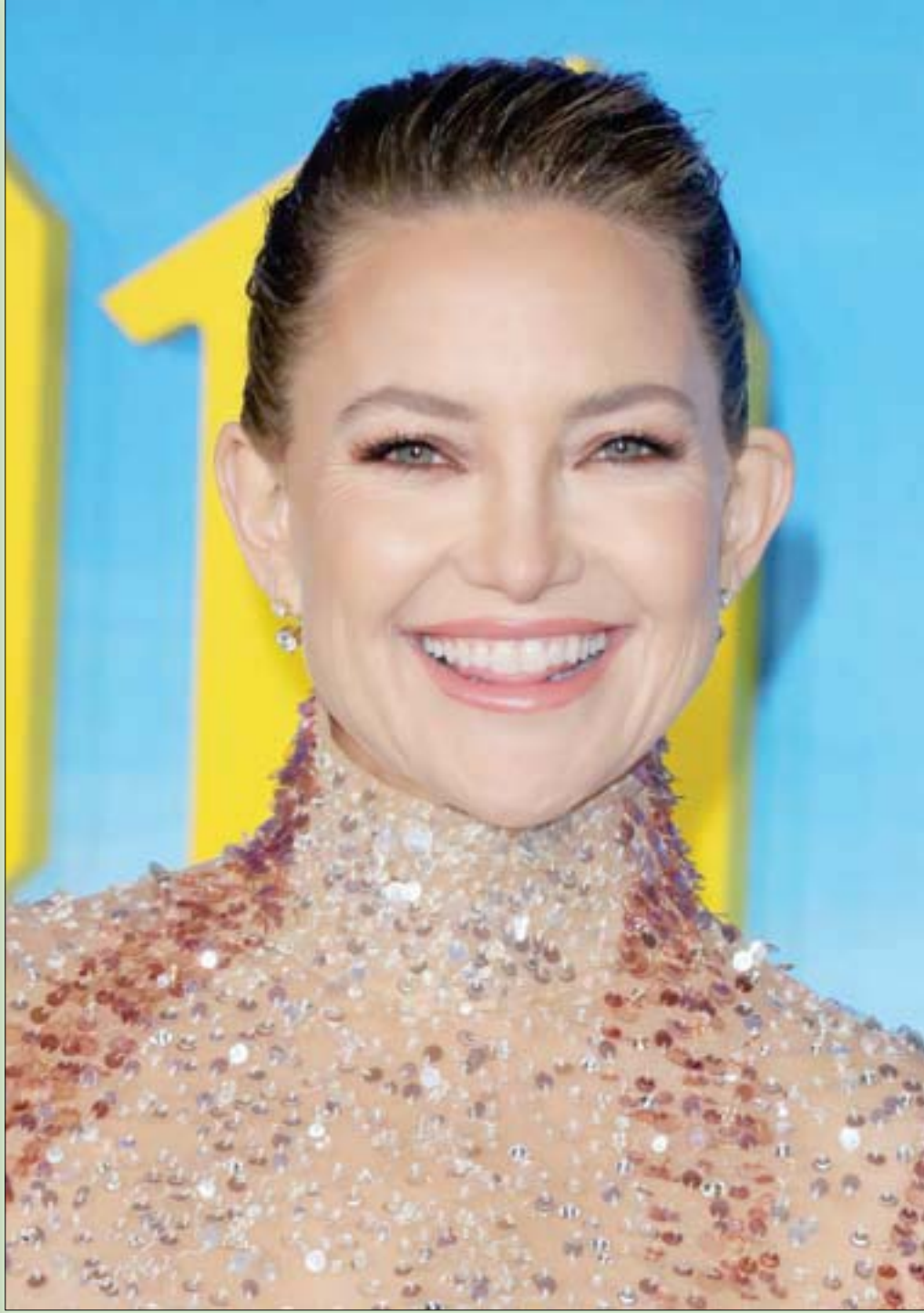
الممثلة الأميركية كيت هيدسون لدى وصولها إلى العرض الأول لفيلم «البصل الزجاجي» في لوس أنجلوس

لأنّ هذا الجبل المصري يستقي معلوماته وتصويراته من المائة البصرية المعروضة له، في منصات مثل «نتفليكس» وغيرها. وعليه، يصبح النزول لهذا الساحة، من طرف أهل الشأن، مسألة بالغة الخطورة. بالمناسبة لاحظت وفرة المواد البصرية عن التاريخ السعودي على منصة «يوتيوب»، لكن أغلبها من صنّاع محتوى غير سعوديين، ولا بأس بذلك، لكنّ قسماً كبيراً منهم لديه أجندة خاصة. بالمناسبة فقط!