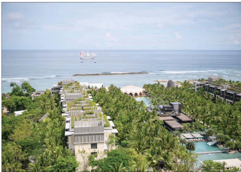
شاطئ نوسا دوا في بالي كما بدأ صباح أمس

بشواطئها الذهبية ومياهها الزرقاء الساحرة، قد لا تبدو بالي خياراً بديها لاستضافة زعماء أكبر ناد اقتصادي في العالم، إلا أن جولة سريعة على مؤشرات إندونيسيا الاقتصادية كفيلة بإقناع أشرس المشككين.