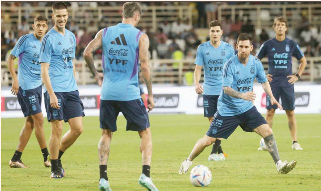
جانب من تدريبات منتخب الأرجنتين في ملعب آل نهيان

أبوظبي، «الشرق الأوسط» يواجه منتخب الأرجنتين لكرة القدم نظيره الإماراتي، الأربعاء، في مباراة دولية ودية يحتضنها استاد محمد بن زايد في أبوظبي الذي سيكون بسعته القصوى، في آخر محطة استعدادية لـ «البيسليستي» قبل خوضه نهائيات كأس العالم 2022 في قطر. وأعلن سابقاً من قبل مجلس أبوظبي الرياضي، الجهة المنظمة للمباراة الأولى من نوعها بين المنتخبين المقامة في الاستاد التابع لنادي الجزيرة المحلي والذي تبلغ سعته 37 ألف مقعد، فناد التذاكر بالكامل بعد أقل من 24 ساعة من طرحها. وساهمت الشعبية التي يتمتع بها نجم الأرجنتين ليونيل ميسي في تهاوت 1986 وخمسة ملايين تذكرة لمشاهدة الأرجنتين في ربع نصف نهائي الموندريال؛ لذلك أريد أن يكون جميع اللاعبين على ما يرام. وتابع الدولي الأرجنتيني السابق وعاشق كرة القدم 47 عاماً «نعرف ميسي وما يمثله للعالم، لذلك قلت للاعبين احرصوا على عدم لمس؛ لأنني حينها لن أستطيع دخول الأرجنتين». واعتبر أن «اللعبة مع الأرجنتين فرصة جيدة للاعبين الإمارات الشباب الذين يحتاجون إلى مثل هذه التجارب، وهي ستكون مهمة بالنسبة لهم للتعلم». وتلعب الإمارات أيضاً أمام كازاخستان