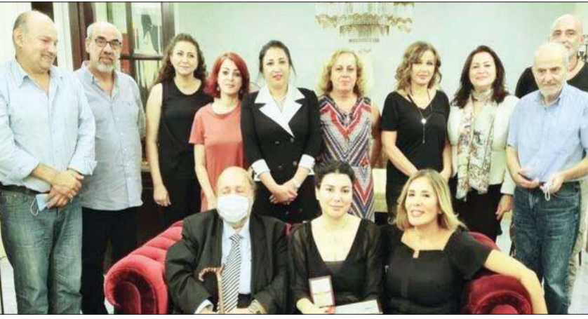
جانب من الحضور في إحدى الفعاليات