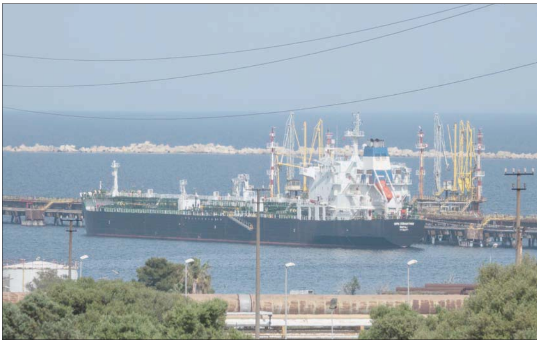
ناقلة نفط روسية ترسو على رصيف بمصفاة «إسب» بالقرب من صقلية اليونانية