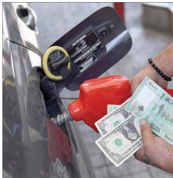
محطة وقود في بيروت (إبأ)

شهيراً بحسب طلبات الجانب اللبناني. وقالت مصادر وزارية لبنانية إن الجانب اللبناني كان حذراً من أن تكرض البلاد لعقوبات أميركية، وتعاين انتظار موافقة أميركية منعا لفرص عقوبات على لبنان، كون قطاع الطاقة الإيراني خاضع للعقوبات. لكن المصادر قالت لـ«الشرق الأوسط» إن المحادثات على مدى الشهرين الماضيين لم تفض إلى نتائج»، حيث «بدا أن هناك تريثاً أميركياً» قبل إعطاء موقف نهائي، مشددة على أن الاتصالات متواصلة. وهاجم رئيس كتلة «حزب الله» النيابية (الوفاء للمقاومة) النائب محمد رعد، ولغاية كعهرباء 10 ساعات يومياً». وهاجم رعد واشنطن بالقول: «لا يقوم بمثل هذا العمل إلا الممانع للخير والمعتدي والأتيم». ويعاني لبنان أزمة انقطاع الكهرباء، بسبب عجز الحكومة