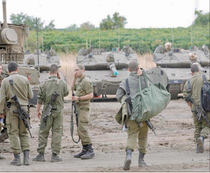
جنود إسرائيليون شاركوا في مناورات عسكرية بالجلولان قبل أيام