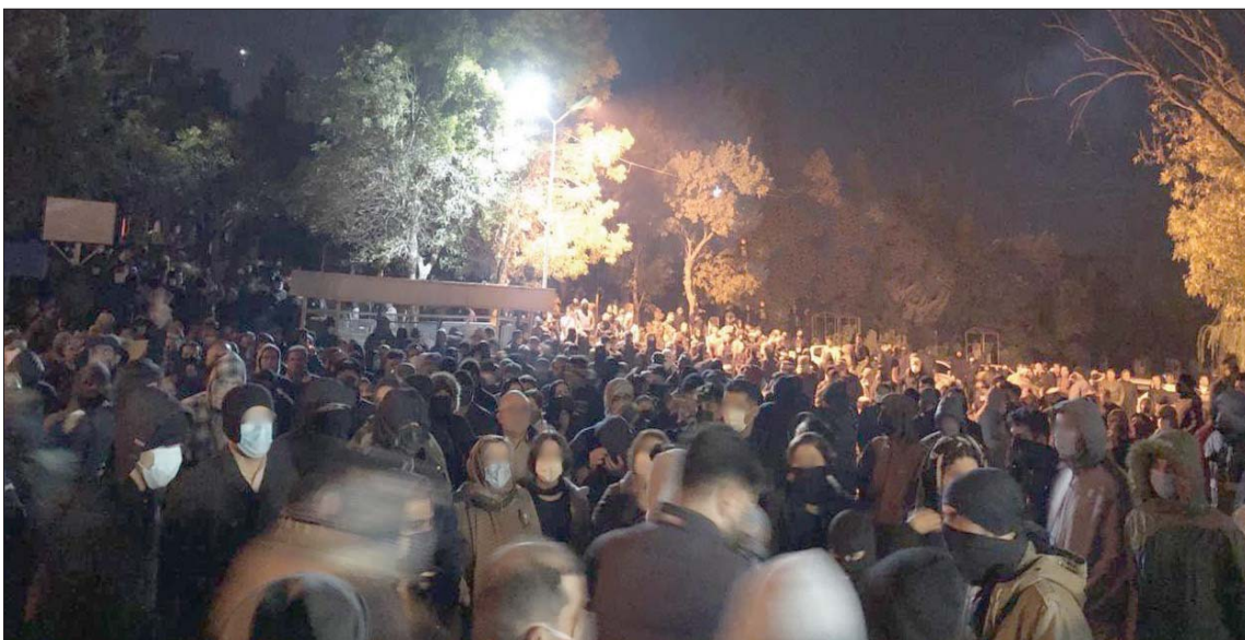
تجمعات في مهاباد فجر الخميس