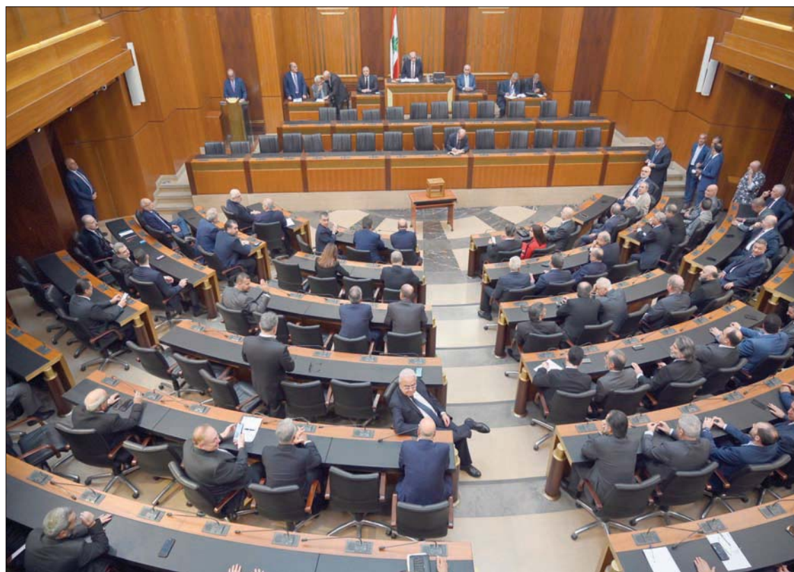
جلسة مجلس النواب اللبناني أمس