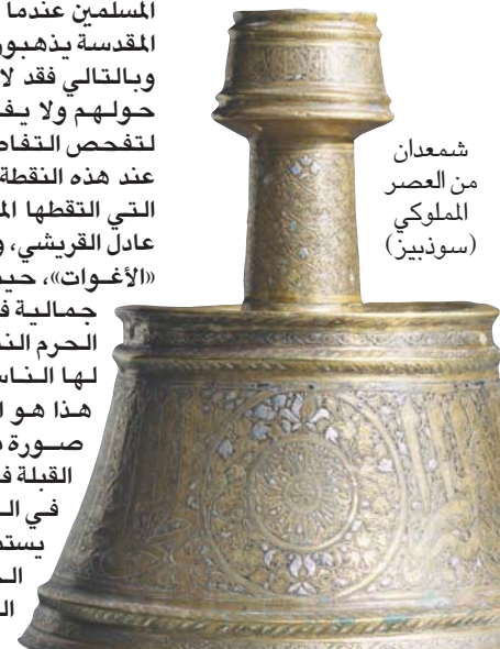
شمعدان من العصر الملوكي (سودبيز)

«الفن الفوتوغرافي وارتباطه بالسعودية قصة كبيرة»، تعبر عبد البر عن إعجاب عميق بأوائل المصورين الفوتوغرافيين الذين سجلوا بعدساتهم أولى لقطات للحرمين الشريفين، وتقول: «المعروف أن محمد صادق بيه، مصور وعسكري مصري هو أول من التقط صوراً للحرمين، حيث زار الحجاج للمرة الأولى في عام 1861 ضمن بعثة الحج الرسمية،