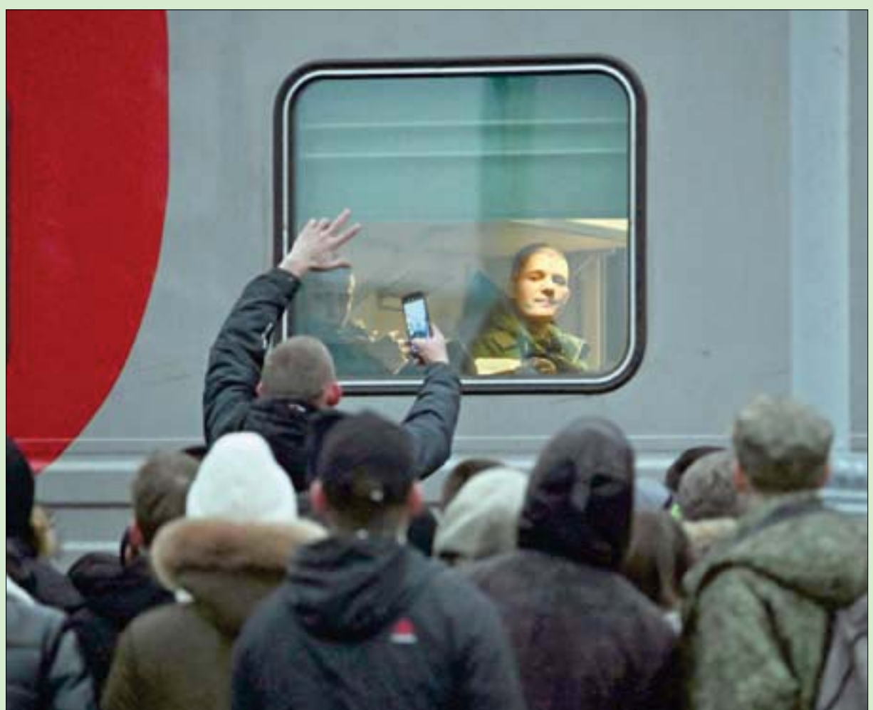
موسكو، راند جبر كيبف - واشنطن - لندن، «التشرق الأوسط»

ازدادت التحذيرات التي يطلقها الأنفصاليون الموالون لموسكو في منطقة زابوريجيا من تصعيد محتمل في المنطقة بعد التطورات التي تشهدها خيرسون. وكان لافتاً أن عضو المجلس الرئاسي لإدارة منطقة زابوريجيا، فالديمير روغوف، أطلق أمس تصريحات تتوقع حدوث معركة مقبلة في المدينة. وأعلن المسؤول الأنفصالي عن وصول 300 مقاتل أوكراني من قوات الوحدات الخاصة الذين جرى تدريبهم أخيراً في بريطانيا إلى زابوريجيا في تحضير لحالة الاستيلاء على المحطة الكهروذرية في المدينة. وقال روغوف: «هناك أكثر من 450 فرداً من قوات العمليات الخاصة، (نخبة القوات الأوكرانية)، الذين تدريبوا في بلدة فولنودريفكا. وانضم 300 مقاتل عادوا من بريطانيا مؤخراً، وهم الآن يتدربون على عبور نهر دنبر، والاستيلاء على محطة زابوريجيا الكهروذرية».