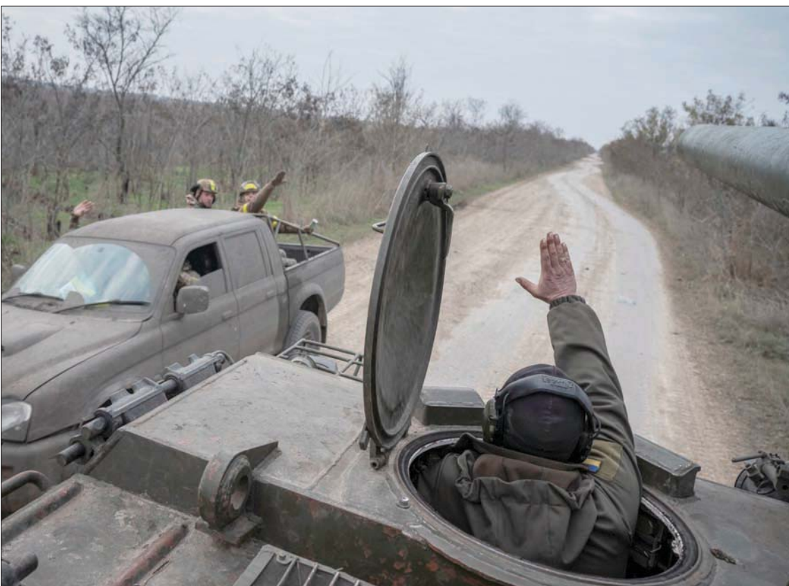
قوات أوكرانية قريبة من خطوط الجبهة في خيرسون

وأضاف: «الآن ليس أوان إجبار أوكرانيا على التفاوض. ربما ضعف الروس لكنهم لن يخلّوا عن تطعاتهم لضم أراض. سيكون من اللازم هزيمتهم في ساحة القتال وطردهم من أوكرانيا». لكن أعلن رئيس هيئة أركان الجيوش الأميركية الجنرال الأمريكي مارك ميلي، الأربعاء، أن أكثر من مائة ألف جندي روسي قتلوا أو جرحوا منذ بداية غزو