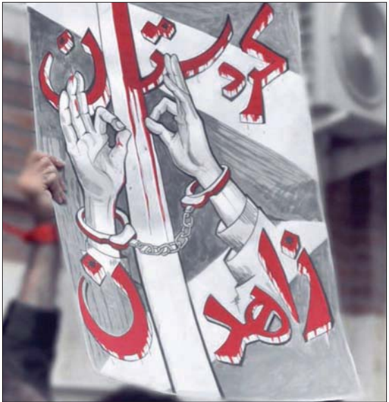
طالب يرغف رسمه تتضامن مع قتلى زاهدان وكردستان في جامعة بارس للفنون المعمارية (الهيئة التنسيقية للطلاب)