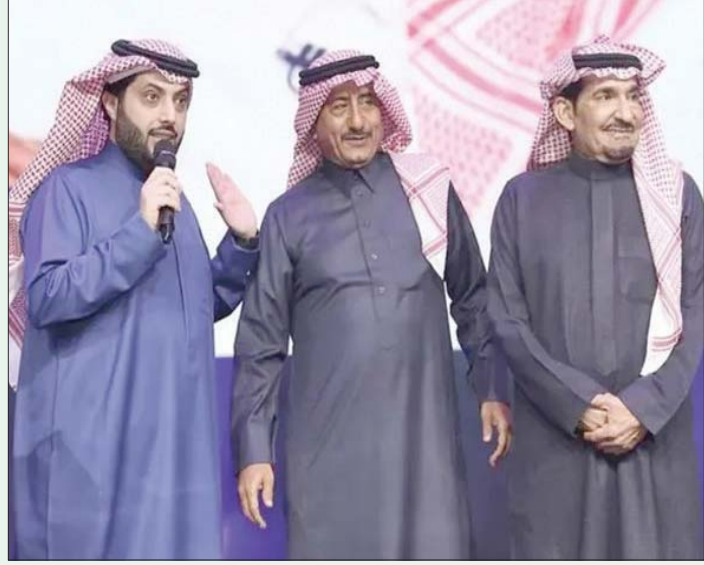
المستشار تركي آل الشيخ رئيس مجلس إدارة الهيئة العامة للترفيه في السعودية مع ناصر القصبي وعبد الله السدحان أثناء الإعلان عن عودة مسلسل «طاش ما طاش»