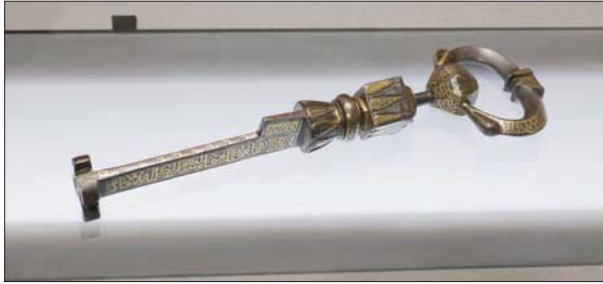
مفتاح الكعبة الموجود بمتحف الوافر (الوافر)

الذي قضى ثلاثة أعوام في كتابتها في الحرم من عام 1854م، وأن يروا جمال الخزف الأزنيقي في الحائط والمحراب، وهي تفاصيل قد لا يراها الزوار للروضة الشريفة بحكم المساحة وضيق الوقت، فنحن سنعرض جزءاً من الجدار في المدينة بامل أن تدفع الزوار للمتعة فيها عند عودتهم لزيارة الحرم».