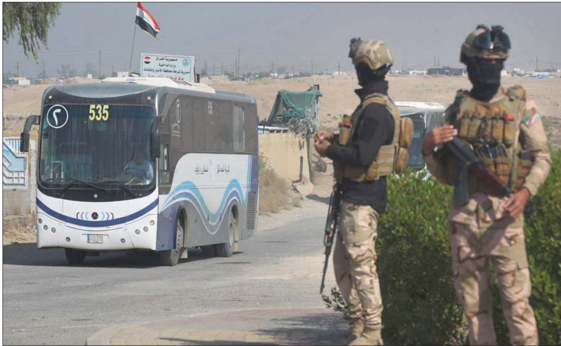
جنود عراقيون يحرسون حافلة تقل عوائل نازحة في مخيم للنازحين بالجنابية في محافظة الأنبار