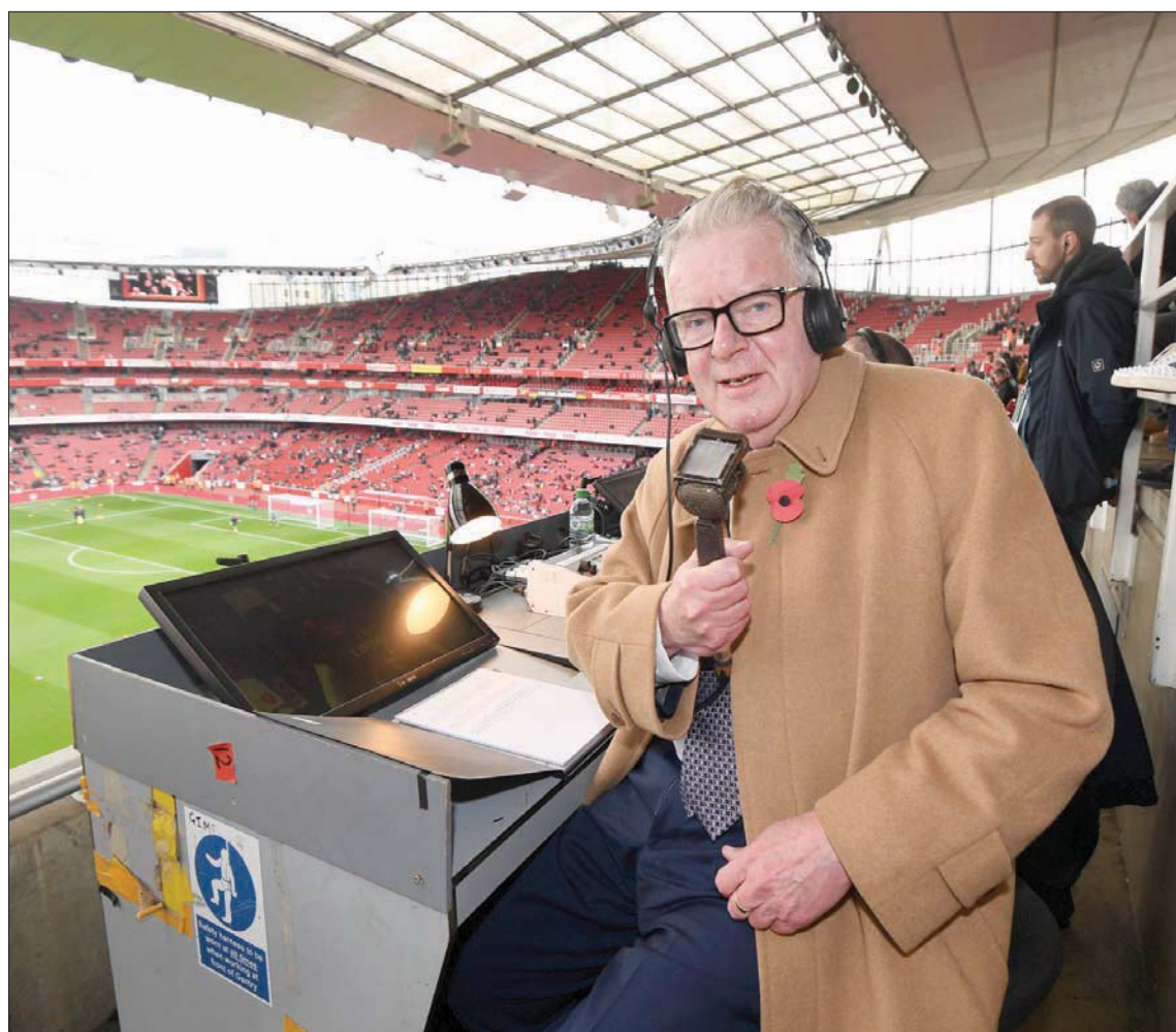
جون موتسون... أحد رواد التعليق على مباريات كرة القدم

مبهمة طبيعية فحسب، بل تتطلب أيضاً قدرة هائلة على تحمل الضغوط والانتقادات في عصر وسائل التواصل الاجتماعي. لقد ظهر معلقو كرة القدم الأصليين في عصر كان فيه التلفزيون لا يزال يرتبط ارتباطاً وثيقاً بالراديو، عندما كانت الصورة