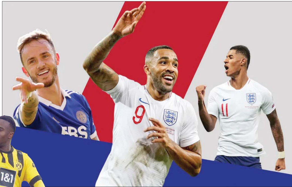
راشفور وويلسون وماديسون نالوا مكافأة لانضمام لتشكيلة إنجلترا

أما هوميلس، الذي شارك في تتويج منتخب ألمانيا بكأس العالم قبل 8 أعوام، فبدأ استبعاده من القائمة بسبب رغبة فليك في الاعتماد على المدافعين الأصغر سناً. وقال رويس: «حلم كبير انتهى لاسف.. لقد حاول الجميع ودلوا كل ما هو ممكن في الأيام القليلة الماضية لجعل مشاركتي في كأس العالم ممكنة، لكن كاحلي المتضرر لم يتعاف تماماً لأعب عن كأس العالم». من جانبه، قال هوميلس: «واحدة من أكبر خيبات الأمل في مسيرتي».