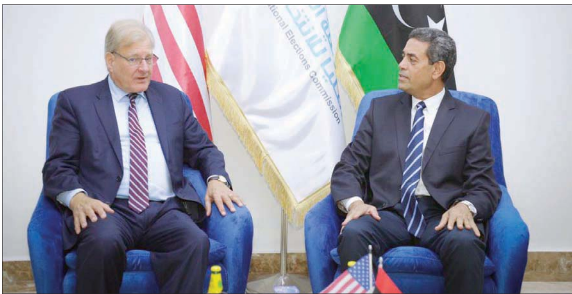
جانب من اجتماع السفير والمبعوث الأميركي الخاص في طرابلس مع رئيس مفوضية الانتخابات

كما أوضحت هذه الأطراف السياسية أن كثيرا من الوجوه النشطة في المجال السياسي والمجتمع المدني، مقربة أو منتسبة لحركة النهضة، وأنها قدمت ترشحاتها لانتخابات البرلمان، وتلق خلال جمع التزكيات دعما من الحركة، على غرار ما حصل في الدوائر الانتخابية بولاية (محافظة) بن عروس، وكذلك بمنطقة طبرية في محافظة مونة، وفي كثير من الدوائر الانتخابية الأخرى، على حد تعبيرها. وكانت حركة النهضة قد أعلنت بصفة رسمية مقاطعتها التامة للمسايرين السياسي والانتخابي في تونس، ولم ترشح أي قيادي من قياداتها المعروفة لهذا الاستحقاق الانتخابي المرتقب. لكن حركة النهضة ليست الوحيدة المتهمه بالترشح سرا للانتخابات البرلمانية المقبلة، حيث اتهم الحزب الدستوري الحر، الذي تزعمه عبير موسى، أيضا باعتما نفس الأسلوب، من خلال دعم ترشح عدد من الأشخاص، الذين سبق أن تقلدوا مناصب في عهد الرئيس السابق زين العابدين بن علي.