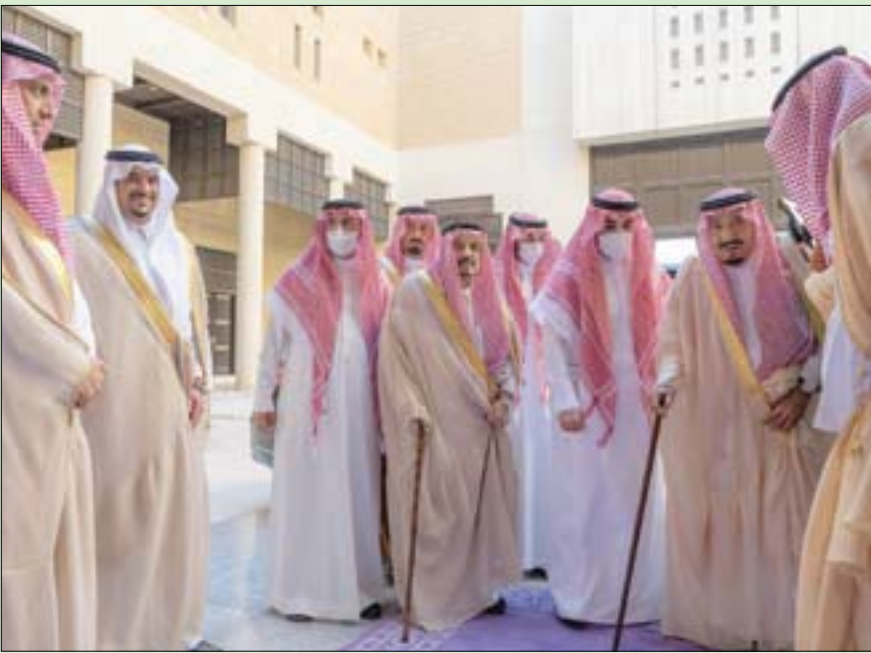
خادم الحرمين لدى وصوله إلى مقر قصر الحكم حيث شملت زيارته إمارة الرياض وقصر المصمك

الرياض، «الشرق الأوسط» زار خادم الحرمين الشريفين الملك سلمان بن عبد العزيز منطقة قصر الحكم في العاصمة السعودية الرياض، أمس الخميس، شملت مقر إمارة منطقة الرياض وقصر المصمك. وتجول خادم الحرمين الشريفين، داخل مبنى الإمارة، واستعرض خلال الجولة تاريخاً للمنطقة. وتوجه خادم الحرمين الشريفين إلى قصر المصمك، حيث تجول في أرجائه وما يضمه من مسجد ومجلس «الديوانية»، وفناء رئيس وأقنية أخرى مكشوفة، ودور علوي، وبعض قطع التراث الشعبي. ويعد المصمك معلماً تاريخياً وتراثياً شرف في بنائه بعهد الإمام عبد الله بن فيصل بن تركي بن عبد الله بن محمد بن سعود، في عام