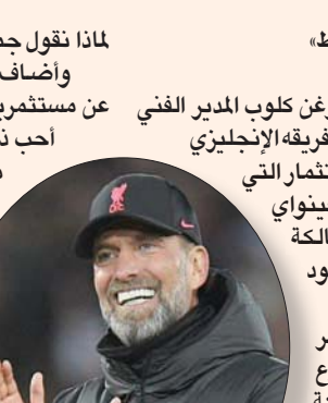
كلوب مدرب ليفربول

لندن، «الشرق الأوسط» أكد الألماني يورغن كلوب المدير الفني للليفربول التزامه مع فريقه الإنجليزي في ظل عروض الاستثمار التي تدرسها مجموعة «فينواي» لسبورت غروب المالكة للنادي، والتي قد تقود إلى بيع النادي. وذكرت تقارير صحفية هذا الأسبوع أن المجموعة المالكة للليفربول، ومقرها في أميركا استعانت بتبني الاستثمار جولدمان ساكس ومورغان ستانلي لإدارة أي صفقة محتملة. وعلق كلوب خلال المؤتمر الصحافي الذي أعقب الفوز الباهت على دربي كاونتي 2-3 بركلات الجزاء الترجيحية في الدور الثالث لكأس المحترفين: «نعمل بالامر منذ فترة أطول بعض الشيء، بشأن أفكار مجموعة فينواي سبورت غروب، ولا أعلم