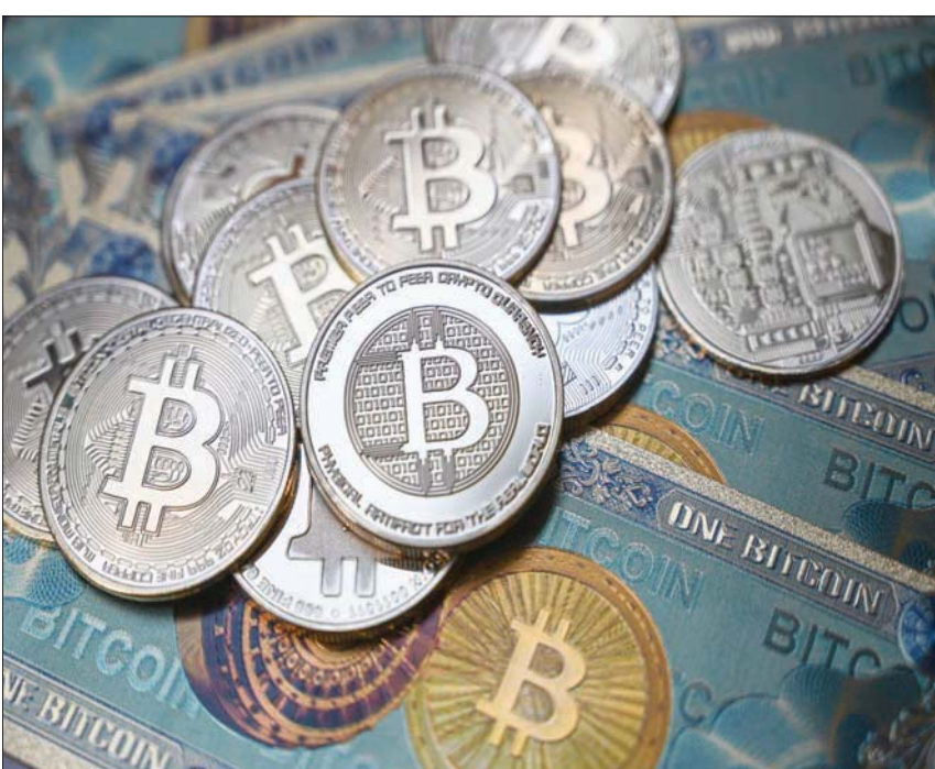
تدهورت أسعار العملات المشفرة بحدة منذ أعلنت «بينانس» الأربعم التخلي عن صفقة استحواذ على منافستها «إف تي إكس» (أ.خ.ب)

تدهورت أسعار العملات المشفرة بحدة منذ أعلنت «بينانس» الأربعم التخلي عن صفقة استحواذ على منافستها «إف تي إكس» (أ.خ.ب) نحو 7,8 مليار دولار، قد تدفقت بين «بينانس» و«نوبيتكس»، وهي أكبر شركة إيرانية لصرف العملات المشفرة. وتقدم «نوبيتكس» على موقعها الإلكتروني نصح حول كيفية تفادي العقوبات. وثلاثة أرباع الأموال الإيرانية التي مرت من خلال «بينانس» كانت باستخدام عملة مشفرة غير مشهورة نسبياً تسمى «ترون» تتيح والأسبوع الماضي أظهرت بيانات نظم للعملات المشفرة أن شركة «بينانس»، عالجت معاملات إيرانية بقيمة ثمانية مليارات دولار منذ 2018 على الرغم من العقوبات الأميركية التي تهدف لعزل إيران عن النظام المالي العالمي. وأظهرت مراجعة لبيانات شركة «تشن أناليسين» الأميركية الرائدة في تحليل نظم العملات المشفرة أن كل المبالغ تقريباً، أو