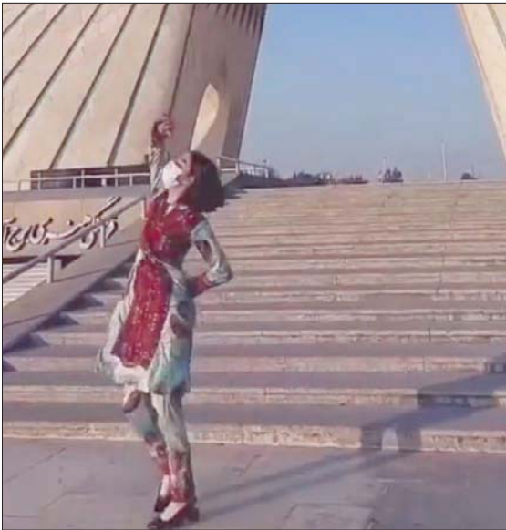
فتاة ترتدي ملابس بلوشية وترقص تحت برج آزادي صباح أمس

التجارية، التي استهدفت بشكل أساسي صور المرشد الإيراني علي خامنئي وقائد «فيلق القدس» السابق قاسم سليماني الذي قضى بضربة أميركية مطلع 2020. وفي الأيام الأخيرة، أشعل المحتجون النار باللوحات الاعلانية التي رفعت شعارات جديدة اعتبروها «محاولة لمصادرة شعارات المحتجين لصالح النظام».