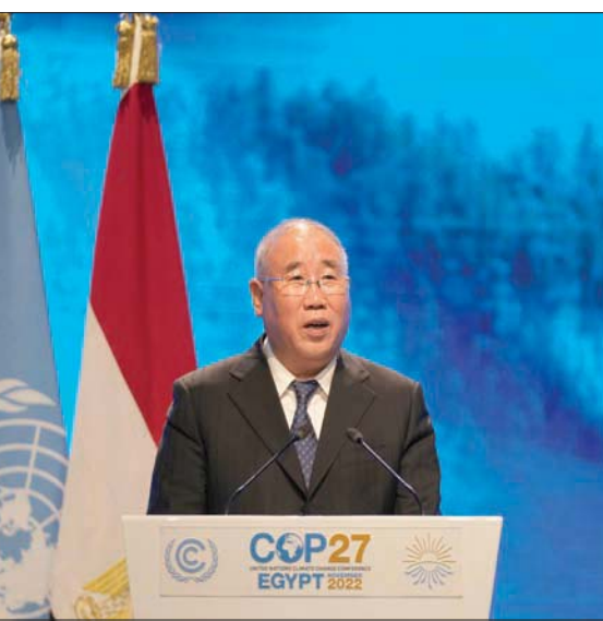
المبعوث الصيني خلال تحفته أمام قمة المناخ في شرم الشيخ

وحصلت صحيفة «هارتس» الإسرائيلية على رد أميركي على تصريحات المسؤول الصيني، وفيه، «إن الصين تلوث الجو أكثر من الولايات المتحدة وأوروبا واليابان معاً، من جراء الاعتماد على الفحم، وهي تعاني أكثر من جميع دول العالم من جراء التغيرات البيئية. وفي مناطقها الشمالية الغربية يوجد خطر فيضانات مدمرة. ومع ذلك قطعت المفاوضات معنا، وحتى بعد لقاء كيري وجنهور، لا يمكن القول إننا عدنا إلى المفاوضات المنظمة».