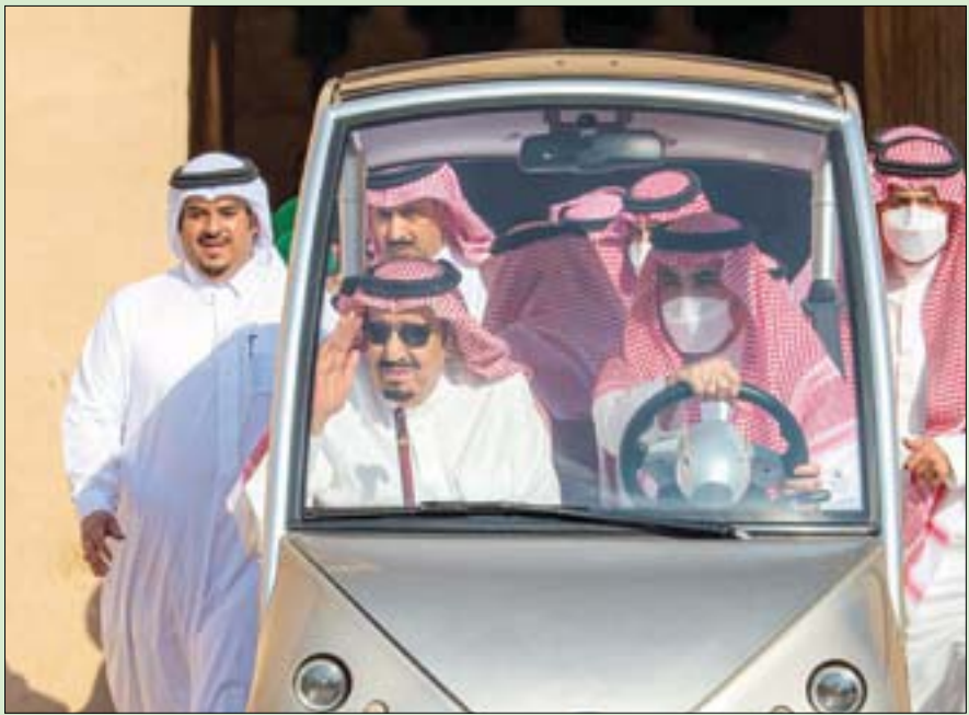
خادم الحرمين الشريفين خلال جولته في قصر الحكم