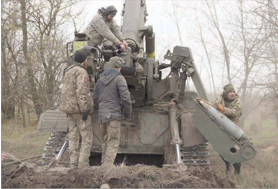
وحدة عسكرية أوكرانية على خط النار في معركة خيرسون التي لم تحسم بعد (إ.ب.أ)

في الوقت ذاته، أعرب عدد من القادة العسكريين عن دعمهم قرار الانسحاب؛ بينهم رئيس جمهورية الشيشان رمضان قديروف، الذي لعبت قواته دوراً أساسياً في معارك دونباس وخاركيف وخيرسون سابقاً، ووصف المسؤول الأمني دعا أخيراً إلى استخدام الأسلحة النووية التكتيكية لحسم المعركة قرار قائد قوات العمليات الحقيقية في أوكرانيا، سيرغي سوروفيكين، حول إعادة نشر القوات في الضفة اليسرى لنهر دنيبر، بأنه قرار صائب وجاء في توقيت مناسب.