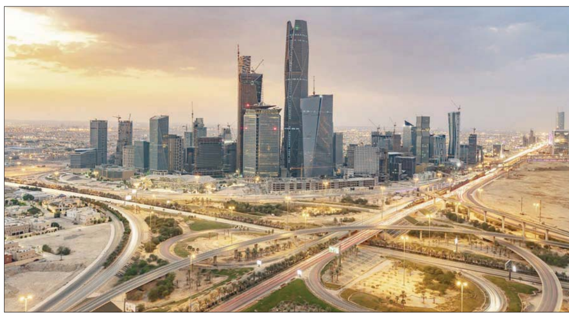
جانب من العاصمة السعودية الرياض