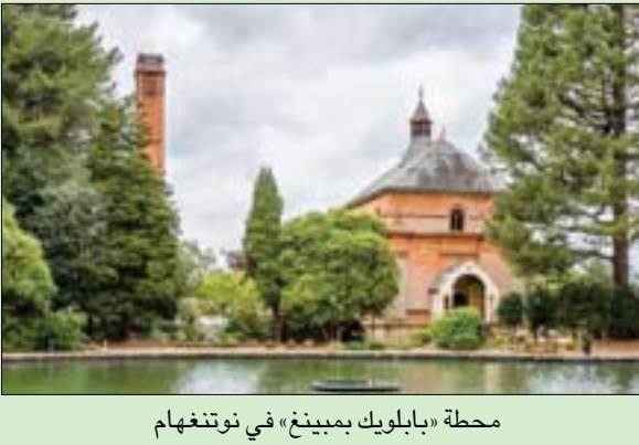
محطة «بابيلويك بيبينغ» في نوتنغهام

ويضيف أوتونكوسكي: «في حين جرى تحديد مئات الجينات المسببة للمرض، فإن البات عمل معظمها كانت لا تزال غير واضحة، وبعبارة أخرى، كان يمكننا تحديد الأفراد المعرضين لخطر كبير للإصابة بالمرض، لكن لم يجر العثور على وسيلة فعالة لمنع تطور المرض دون التعرض لخطر الآثار السلبية الكبيرة، والدواء المقترح يمكن أن يكون حلاً مناسباً».