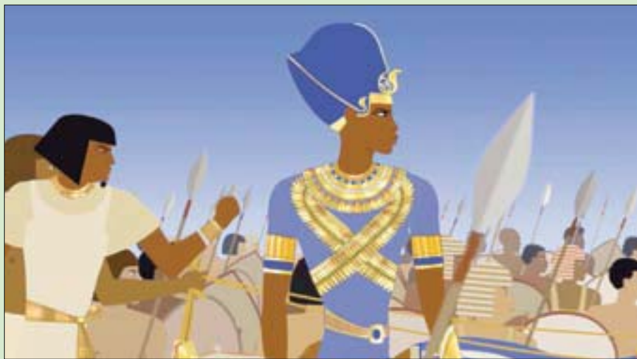
فيلم «الفرعون والهجمي والأميرة» للفنان الفرنسي ميشيل أوسيلوت

وبميرزا جميعاً الجمال البصري الذي شكلته أعمال الفنان الفرنسي الشهير ميشيل أوسيلوت، الذي يصحبه بداية في رحلة إلى السودان في العصر الفرعوني، للتعرف إلى أول فرعون أسود البشرة، ثم يسافر بنا إلى فرنسا في العصور الوسطى، حيث تدور وقائع الثورة الفرنسية التاريخية، وينتهي بنا في تركيا في القرن الثامن عشر، حيث يبحث الأمير المنفي عن أميرته المحتجبة. حصل على جائزة سينز لأفضل فيلم قصير، فيلم ميشيل أوسيلوت القصير «المخترعون الثلاثة» (1980) على جائزة سينز لأفضل فيلم متحرك، كما فاز فيلمه «أسطورة الفقير الأحمد» (1983) على جائزة سينز لأفضل فيلم متحرك قصير، ثم ناسف بفيلمه «حكايات الليل» (2011) في مهرجان برلين السينمائي الدولي، بينما حصل على «ديبلي في بايرس» (2018) على جائزة سينز.