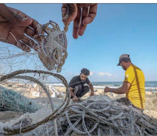
صيادون على الشاطئ في غزة (أ.ب)

وقال رئيس «اتحاد لجان عمل الصيديين» زكريا بكر، إن القرار ظالم، وأضاف: «الاحتلال الإسرائيلي يتخذ قراراً بشيء للتخصيص على قطاع غزة لصياديه، وهو يهدف لتدمير قطاع الصيد وإفراغ بحر غزة من الصيديين، والعمل بكل الصيد على أن يكون قطاعاً اقتصادياً، فهو يمنع غير مُجد اقتصادياً، فهو يمنع منذ سنوات، إدخال المعدات لنا ويحدد ويقيد مساحات الصيد».