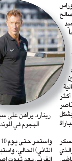
رينارد يراهن على سياسة الدفاع قبل الهجوم في المونديال