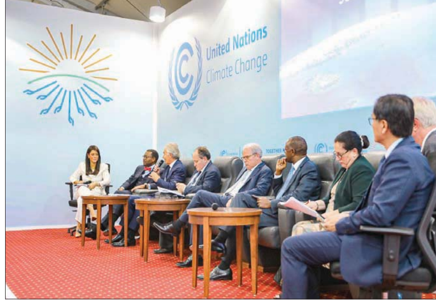
جانب من الحضور الدولي لدى إطلاق «دليل التمويل العادل» في مدينة شرم الشيخ

بأهداف تتصل بتحفيز تمويل المناخ، وتعزيز التعاون متعدد الأطراف، وتطوير أفكار التمويل المبتكر، وفي ظل تخافق فجوة التمويل المناخي خاصة عقب جائحة كورونا، أطلقت قمة «كوب 27» «دليل شرم الشيخ للتمويل العادل»، ليكون عوناً في وجه التحديات التي تواجه الدول النامية والاقتصادات الناشئة لا سيما دول قارة أفريقيا في الحصول على التمويل لتحقيق طموحاتها في أجندة المناخ.