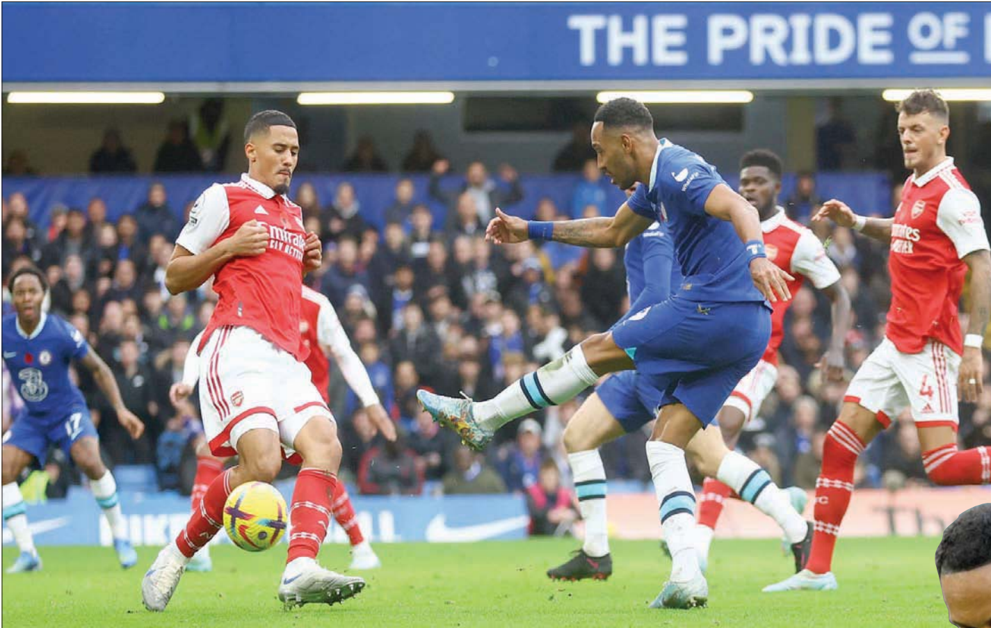
أوباميانغ فشل في إحراز أي هدف في آخر 6 مباريات بالدوري الإنجليزي... آخرها الهزيمة أمام أرسنال

من المتوقع أن يتعاقد تشيلىسي مع كريستوفر كونكو من ريد بول لايبزيغ الصيف المقبل، كما أن نجم ميلان، رافائيل لياو يعد خياراً آخر، وهناك شعور بأن الهجوم المثالي لبوتز في النمذج الذي يفضلها أرتيتا، وقيل بها مهاجمون مثل كوستا وديديه دروغبا، فإنه قادر على استغلال أضعاف الفرص ووضع الكرة داخل الشباك، وهو الأمر الذي أظهره للجميع عندما تسلم الكرة واستدار ببراعة ووضعها في المرمى، محرراً هدف التعادل في مرمى كريستال بالاس،