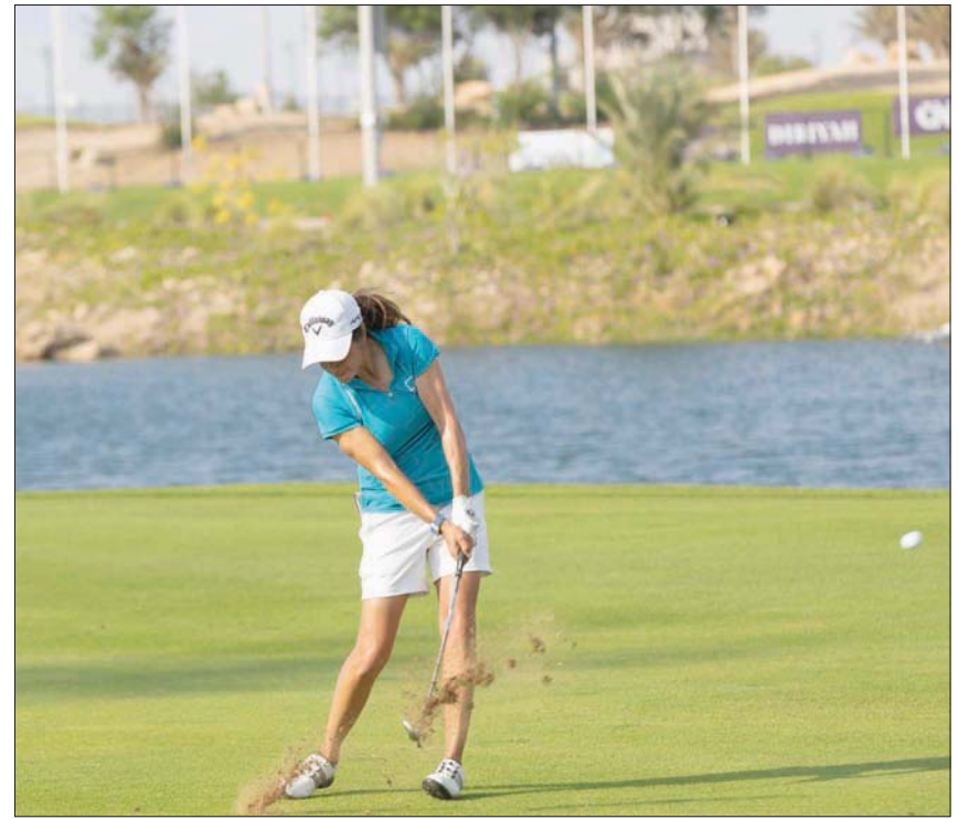
إحدى اللاعبات خلال منافسات يوم أمس في جولة أرامكو للغولف