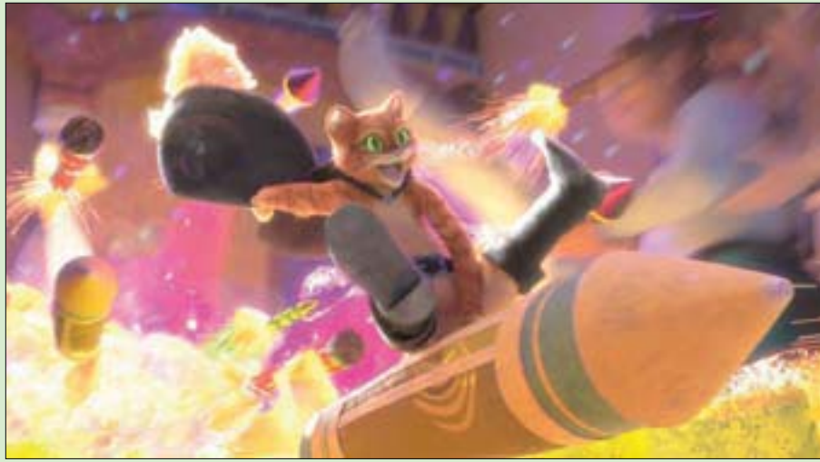
مشهد من فيلم «القط ذو الحذاء: الأمنية الأخيرة»

جوستافوسون الفيلم الروائي الرائع بينوكيو من غيرمو ديل تورو، الذي تم تصويره بتقنية إيقاف الحركة، وتدور أحداثه حول النجار جيبينو الذي عاش في ثلاثينيات القرن الماضي في إيطاليا تحت حكم موسوليني، وهيمن الحزن على حياته بعد فقده لابنه كارلو وهو في عمر الـ10 سنوات. ويواسي جيبينو حزنه بصنع دمية خشبية سماها بينوكيو التي يقدر لها أن تتحول إلى صبي حقيقي وتبدأ مغامراتها. كما يشارك المخرج الفيتنامي هام تران الحاصل على الماجستير في الإخراج من جامعة كاليفورنيا لوس أنجلوس