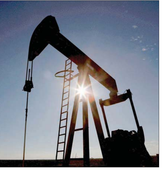
منصة نفطية في حوض برميان بولاية تكساس الأميركية

انخفاض خام غرب تكساس الوسيط بأكثر من سبعة في المائة. وأعلنت مدينة غوانغتشو الصينية، مركز الصناعات التحويلية، يوم الخميس تسجيل أكثر من ألف إصابة بمرض (كوفيد - 19) وهو ثالث يوم تتجاوز فيه الإصابات هذا المستوى في أسوأ فاش تشهد المدينة حتى الآن. وطالبت السلطات ملايين السكان يوم الأربعاء بإجراء الفحوصات الخاصة بالمرض، وفرضت إغلاقاً على أحد الأحياء، بينما بلغت الإصابات المحلية في الصين أعلى مستوياتها منذ 30 أبريل (نيسان) الماضي. وكان من المتوقع أن تظهر بيانات مؤشر أسعار المستهلكين في الولايات المتحدة، التي