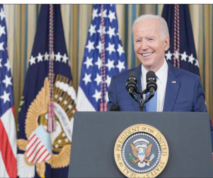
بايدن عقد مؤتمر صحفياً في البيت الأبيض الأربعاء

وقال بايدن، مساء الأربعاء، في أول تصريحات أدلى بها منذ انتهاء التصويت: «اعتقد أنه كان يوماً جيداً بالنسبة للديمقراطية».