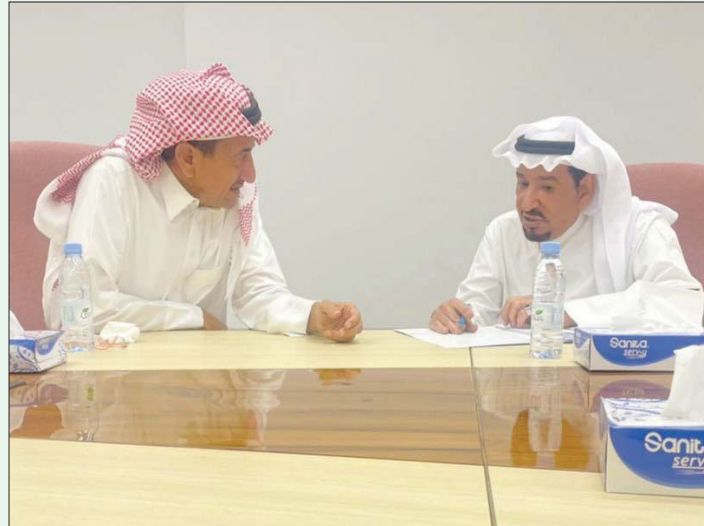
الفنانان عبد الله السدحان وناصر القصبي يتحاوران

ويبدو أن هذا الإعلان سيرفع رسالة نصية بها المستشار تركي آل الشيخ عبر حسابه في موقع التواصل الاجتماعي «تويتر» مرفقاً صورة للفنانين عبد الله السدحان وناصر القصبي يتحاوران إلى طاوله واحدة، معلقاً عليها: «التحضير (طاش ما طاش) إن شاء الله رمضان القادم مع العملاقة (mbc)».