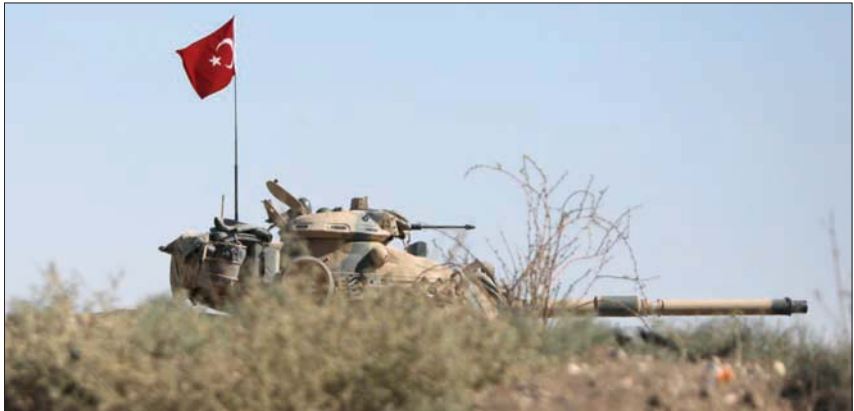
دبابة تركية في الشمال السوري

وإرسال المزيد من اللاجئين السوريين إليها. وهددت في مايو (أيار) الماضي بعملية عسكرية تستهدف المدنيين، لكن الحديث عنها توقف، بسبب رفض روسيا والولايات المتحدة والائتلاف الأوربي أي تحرك عسكري جديد لتركيا في المنطقة. في غضون ذلك، قصفت القوات التركية المتحركة في قرية جليل، بالمدفعية الثقيلة، محيط قريتي المياسة وأبين بناحية شيرأوا بريف عفرين، شمال غربي حلب، وردت قوات «قسد» بقصف محيط قرية كيمار.