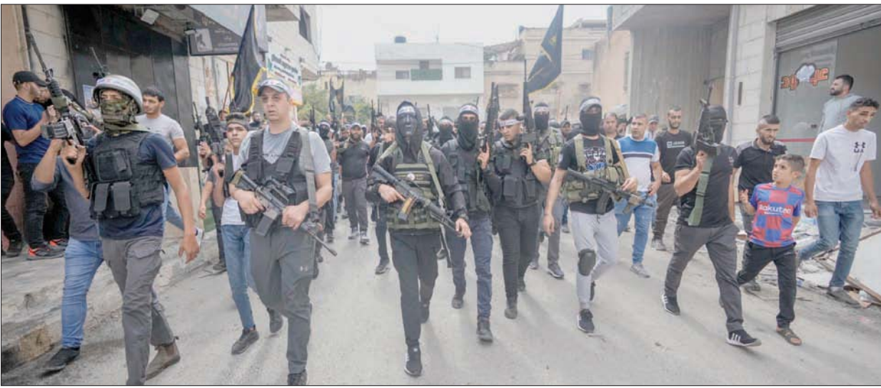
من المجموعات المسلحة في جنين