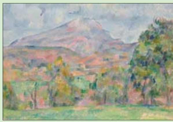
لوحة بول سيزان من المزداد (كريستيز)

التصويرية مثل صورة إدوارد مانهيه «القتال الكبير في فينيسيا» Le Grand Canal à Venise و The Conversation، أو المحادثة، التي تصور المسوق هنري جيلزوالر والكاتب ريموند قوي منهمكين في حوار عصبى. وفي السياق ذاته، قال ديفيد ناش، الذي عمل مستشاراً فنياً، إن «قطب التكنولوجيا تعامل بحماس طاهر في شراء اللوحات بنفس درجة حماسه في تعاملاته المتعلقة باهتماماته الأخرى، التي تضمنت الفرق الرياضية والبيولوجيا البحرية وأبحاث الدماغ». وأضاف قائلاً: