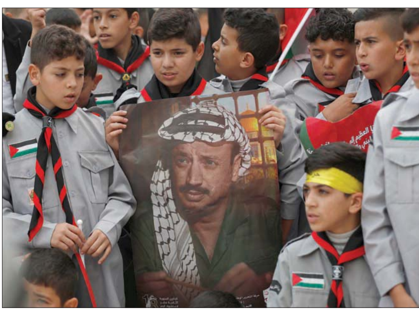
تلامذة في رام الله يحملون صورة عرفات