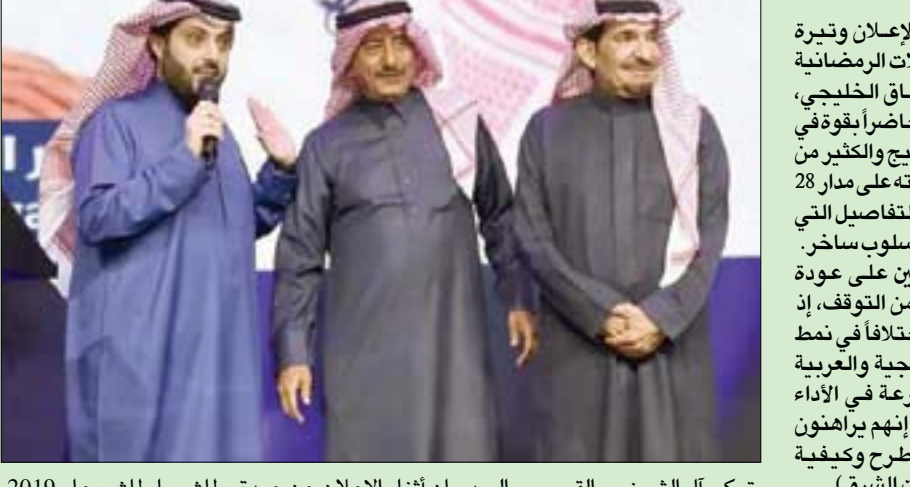
تركي آل الشيخ مع القصبي والسدحان أثناء الإعلان عن عودة «طاش ما طاش» عام 2019