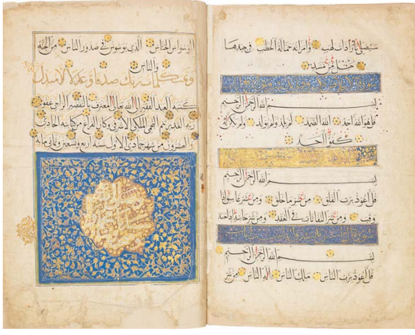
مصحف السلطان قايتباي بيع في دار كريستيز عام 2019

العالم الكبرى، ويعمل القيمون على البياني على استعادة بعض تلك القطع لعرضها على الجمهور. تقول عبد البر: «طلبتنا من متحف برلين والوفور بباريس ومتحف الفن الإسلامي بالقاهرة وغيرها، بعض القطع النادرة»، مثل نسخ من مفتاح الكعبة من الوافر ومن القاهرة. غير أن المؤسسات السعودية تحفل بقطع تمثل مراحل من التاريخ الإسلامي، تعود عبد البر للحديث عما تضمه تلك المؤسسات والمجموعات من قطع فنية مهمة ومتفردة، مثل مصحف أمهات السلطان الملوكي قايتباي للمدرسة الأشرفية في مكة، وشمعدانات كان مهداة للحجرة النبوية من السلطان قايتباي، هناك أيضاً المنسوجات والسناثر التي صنعت وأهدت