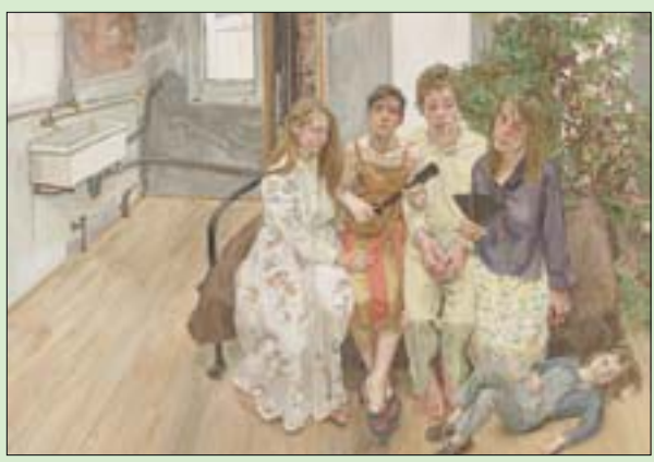
لوحة لوسيان فروييد في المزداد

النادرة التي تعرض في السوق. فمبيعات مثل هذه لا تعكس سوق الفن كله، بل الرغبة في اقتناء الأعمال النادرة والاستثنائية. من المهج جداً فهم أهمية مثل هذه الأعمال الأسطورية الفريدة». وصلت عملية البيع رقم مليار دولار بالقطعة رقم 32، وهي منحوتة «Femme de Venise III» لالبرتو جياكوميتي،