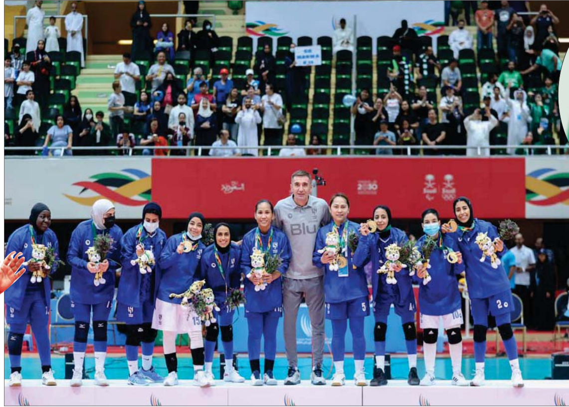
سيدات «طائرة» الهلال يحتفلن بالذهب