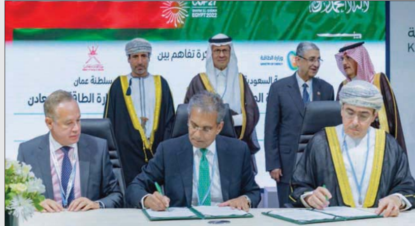
جانب من مراسم توقيع مذكرة تفاهم بين جهاز الاستثمار العماني وشركة «أكوا باور» السعودية لدراسة الاستثمار في رياح السويس للطاقة

الطاقة، الذي يشمل تعزيز التعاون في الطاقة المتجددة، والكهرباء، وكفاءة الطاقة، والهدروجين، وتطبيق نهج الاقتصاد الدائري للكربون وتقنياته للحد من آثار تغير المناخ، والبتترول، والغاز، والبتروكيماويات، وتطوير المعايير لدعم استخدام المواد المستدامة بدلاً من المواد التقليدية. كما تشجع المذكرة التعاون الرقمي، والابتكار، والتعاون بين الشركات المختصة، وتنمية الشراكات النوعية فيما يتعلق بنوطين المواد والمنتجات والخدمات وسلاسل الإمداد وتقنياتها، وذلك في جميع مجالات الطاقة.