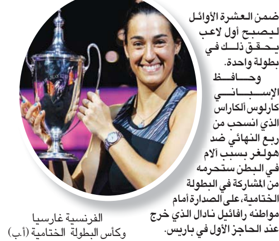
الفرنسية غارسيا وكأس البطولة الختامية

ساکاري التي خسرت ضد غارسيا في نصف النهائي، مركزاً لتصبح سادسة. وبالتسوية للرجال، اخترق الدنماركي الشاب هولغر رونه قائمة العشرة الأوائل للمرة الأولى بعد تتويجه بدورة باريس - بيرسي للماسترز على حساب الصربي نوفاك ديوكوفيتش الذي خسر مركزاً. وبات هولغر أول دنماركي يدخل قائمة العشرة الأوائل إثر تقدمه 8 مراكز بعد أن أصبح أصغر لاعب يتوج في العاصمة الفرنسية منذ الألماني برونيس بيكر في 1986، مزيحاً في طريقة خمسة لاعبين