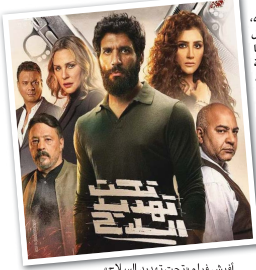
أفيش فيلم «تحت تهديد السلاح»

وفاجا الرداد جمهوره، الذي اعتاد عليه في أعماله التي تنتمي إلى «الكوميديا الرومانسية» بتقديم شخصية شاب مخدوع يقع ضحية مؤامرة، ولا يعتمد على شعوره، بل يظهر أشعث من سمير غانم ودلال عبد العزيز، والذي زوجته الفنانة إيمي سمير غانم. وكتب الرداد على صفحته الرسمية في «فيسبوك» معبراً عن «شكره العميق لكل من وقف إلى جانبه في هذا الفيلم بعد الظروف التي ألمت به أخيراً»، معتبراً أن هذا العمل يعد «حالة خاصة ومختلفة».