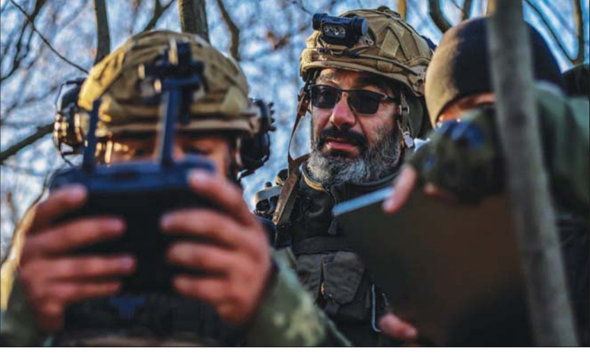
وحدة قتالية أوكرانية توجه طائرة مسيرة على خطوط الجبهة الشمالية في خيرسون

تضيق القوات الأوكرانية الخناق على خيرسون، بينما تقوم روسيا ببناء الدفاعات داخلها. ويرى الجانبان أن المدينة مهمة ويجب السيطرة عليها. ومع ذلك، يقول الخبراء العسكريون إن المعركة من أجلها قد تكون مكلفة للغاية. واتهمت أوكرانيا روسيا بنهب المنازل الخالية في المدينة الواقعة جنوب البلاد واحتلالها عبر إرسال جنود بملايس مدنية استعداداً للقتال في الشوارع، فيما يتوقع الجانبان أنها ستكون معركة من أهم معارك الحرب. وقال فوريس ماكنزي ضابط سابق في مشابرات الجيش البريطاني إن الهجوم لاستعادة السيطرة على خيرسون سيكون مكلفاً للغاية للقوات الأوكرانية. ويوضح لهيئة البث البريطاني (بي بي سي): «سيكون القتال من منزل إلى منزل، وسيكون معدل الإصابات مرتفعاً للغاية... التوقعات مروعة». ومع ذلك، فإن معركة ضارية من أجل المدينة ليست حتمية، كما يقول باي من المعهد الدولي للدراسات الاستراتيجية، وتابع: «كل جانب خيارات... القوات الروسية قد تقاتل لتأخير الأوكرانيين ثم تتسحب. قد يحاول الأوكرانيون تطويق المدينة وقطع خطوط الإمداد بدلاً من دخولها. من المستحيل التنبؤ باستراتيجيات القوات». وقال الجيش الأوكراني في تحديث ليلي إن القوات الروسية