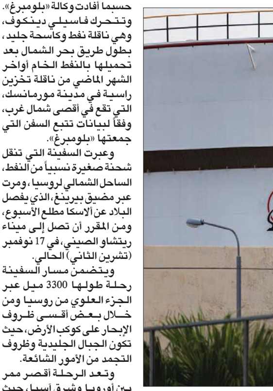
علم الصين يرفرف أمام محطة نفط تابعة لشركة «سينوك» الصينية

أسس الثلاثاء، «وضع سقف لسعر النفط الروسي أمر صعب التطبيق». وأرسلت موسكو ثاني شحنة، على الإطلاق، من النفط الخام الروسي شرقاً عبر دائرة القطب الشمالي باتجاه الصين، وهو طريق يمكن أن يكون الأسرع في مقابلة مع «سي إن بي سي»،