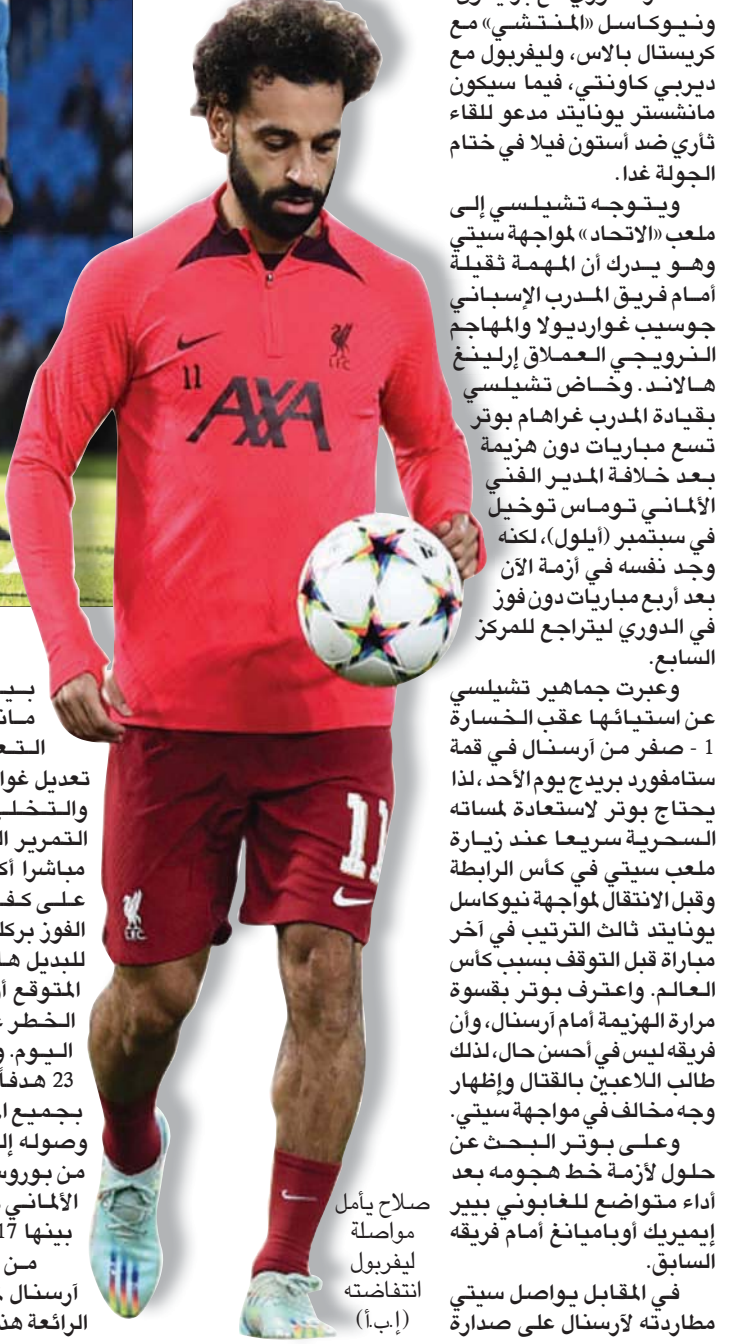
صلاح يأمل مواصلة ليفربول انتفاضته

بيريرا بنجاح مانحا الفريق التعادل 1 - 1 مع تعديل غوارديولا للطريقة والتخلي عن أسلوب التمهير السلس ليصبح مباشرة أكثر، نال مكافأة على كفاحه بتحقيق الفوز بركلة جزاء متأخرة للبدل هالاند، الذي من المتوقع أن يكون مصدر الخطر على تشيلسي اليوم. وسجل هالاند 23 هدفا في 16 مباراة بجميع المسابقات منذ وصوله إلى سيتي قادما من بوروسيا دورتموند الألماني خلال الصيف، بينها 17 في الدوري. من جهته يتطلع أرسنال لمتابعة عروضه الرائعة هذا الموسم بقيادة