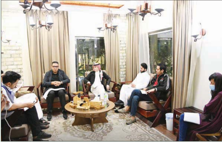
تهدف معتزلات الكتابة إلى توفير المزيد من الفرص لتبادل التجارب والخبرات بين الكتاب المحليين والعالميين

الرياض، عمر البديوي مؤقتة، كان يعيد ترتيب أوراقه أو ليكتب أو يتأمل أو يتخذ قراراته ثم يعود لطبيعته، والتفكير مرتبط بالتأمل، كعمارة تحقق الإلهام والتفكير، الذي يكتنف الروح في سكوت العزلة، وفي حال اجتمعت ملكة الكتابة مع سمة العزلة في شخص واحد، حينها ستكون العزلة الكتابية طقساً مقدساً.