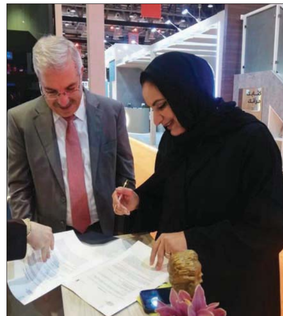
توقيع الاتفاقية في معرض الكتاب بالشارقة