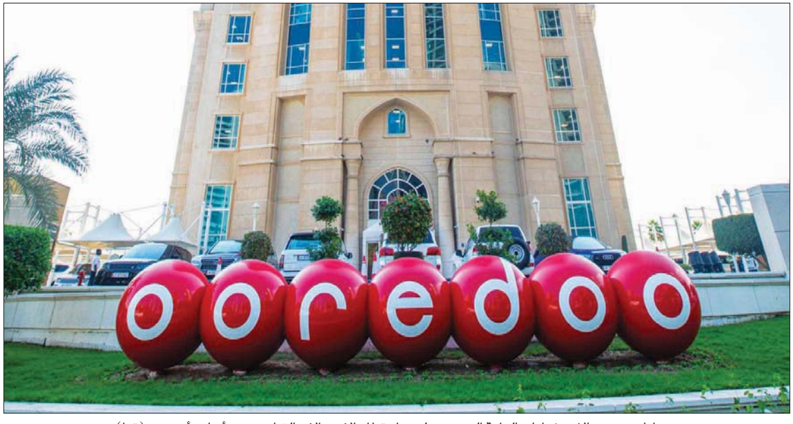
يخطط صندوق الاستثمارات العامة السعودي لدخول قطاع الاتصالات القطري عبر أبراج «أوريدو»

«طور عالمك»، الذي يدور حول تمكين التطور الإنساني، الأمر الذي يعكس التزام الشركة بالاستثمار في تحسين مختلف ذلك. وأعلنت سبتمبر (أيلول) الفاتح عن خطتها لبيع شركة