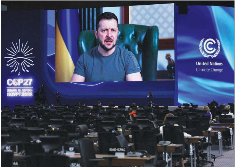
زيلينسكي يخاطب زعماء العالم في قمة المناخ في شرم الشيخ

كييف - موسكو - واشنطن، «الشرق الأوسط» كررت كييف موقفها الرفض للتفاوض مع موسكو، ما دام الرئيس الروسي فلاديمير بوتين متربحاً على هرم السلطة، مضيفة عبر أحد كبار مستشاري الرئيس الأوكراني، أنها مستعدة لإجراء محادثات مع رئيس روسيا المستقبلي، وليس الحالي، فيما نفت أمس الثلاثاء تعرضها لضغوط غربية للدخول في مفاوضات مع روسيا، ووجدت تسكها بعدم إجراء أي محادثات إلا إذا انسحبت روسيا من كافة الأراضي التي تحتلها. وقال ميخائيلو بودولياك أحد كبار مستشاري الرئيس الأوكراني على تويتر عقب تقرير لصحيفة واشنطن بوست يوم السبت ورد فيه أن حكومة الرئيس الأمريكي جو بايدن كانت تحت قيادة أوكرانيا سرا على الإشارة إلى أنها منفتحة على التفاوض مع موسكو: «لم ترفض أوكرانيا التفاوض قط. موقفنا من التفاوض معروف ومعلن»، قائلاً إن روسيا ينبغي أن تسحب قواتها من أوكرانيا أولاً. وأضاف: «هل بوتين مستعد؟ قطعاً لا. لذلك نحن واضعون في تقييمنا... نستحدث مع الرئيس القادم (روسيا)». أما موسكو فقد ردت قائلة إنه ليس لديها أي شروط مسبقة باستثناء «أن تظهر أوكرانيا حسن النية». وقالت على لسان نائب وزير خارجيتها أندريه رودكو إنه ليس لديها شروط مسبقة لإجراء مفاوضات مع أوكرانيا، لكن