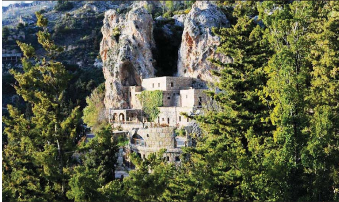
متحف جبران المنحوت في صخر بلدته بشري