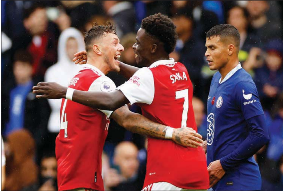
أفراح في أرسنال وأحزان في تشيلسي بعد فوز «المدفعية»

لقد تولى بوتر تدريب تشيلسي في 12 مباراة، اعتمد في 7 منها على 3 لاعبين في الخط الخلفي، ولعب في اثنين منها -ضد ولفرهامتون، وضد سالزبورغ على ملعبه- بطريقة يمكن أن تكون أقرب إلى 1-3-2-4، كان يقدم فيها الظهير الأيمن للأمام بشكل مستمر، بينما يتراجع الجناح الأيسر كثيرا للخلف من أجل القيام بالواجبات الدفاعية. ويعكس هذا ميل المدير