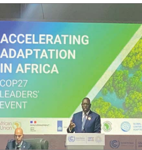
جانب من ندوة حول مساعدة أفريقيا على التكيف مع التغير المناخي في شرم الشيخ أمس

«كوب 27»، إلى «بذل جهود كبيرة للحد من الانبعاثات الكربونية»، موضحاً أنه «للحفاظ على الهدف المناخي بالإبقاء على ارتفاع درجات الحرارة عند 1,5 درجة، لا بد من تمويل على سبيل المثال»، مشيراً إلى أن «هذه الحلول تبقى -بلغة المناخ- حلولاً بيضاء... أي قررها الرجل الأبيض، دون أن يأخذ في اعتباره احتجاجات دول الجنوب»، ويضيف أن «دعم التحول البيئي في مصلحة الجميع؛ سواء في الشمال أو الجنوب».