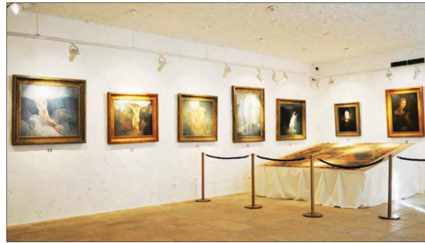
من صالات المتحف (الشرق الأوسط)