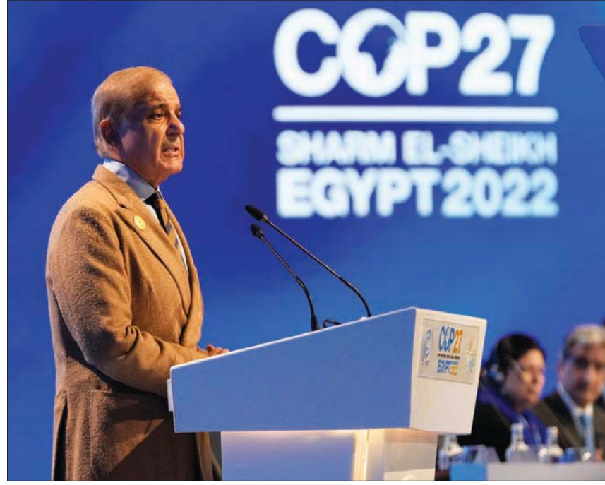
رئيس الوزراء الباكستاني يتحدث أمام «كوب 27»

شكّل مؤتمر الأطراف لاتفاقية الأمم المتحدة حول المناخ «كوب27» فرصة لسماع صوت الدول الفقيرة والأكثر تضرراً من التغيرات المناخية، رغم «ضعف» مساهمتها في الانبعاثات الكربونية، وشهدت جلسات اليوم الثاني من الشق الرئيسي لقمة المناخ كلمات لقادة دول وحكومات باكستان وسيريلانكا وغانا، ودول جزرية صغيرة مثل أنتيغوا، ركزت في مجملها على مطالبة الدول الصناعية الكبرى (دول الشمال) بالتعويض عن الأضرار التي لحقت بدولهم من تبعات التغيرات المناخية، وتحمل تكاليف ما تسببت به من خسائر اقتصادية.