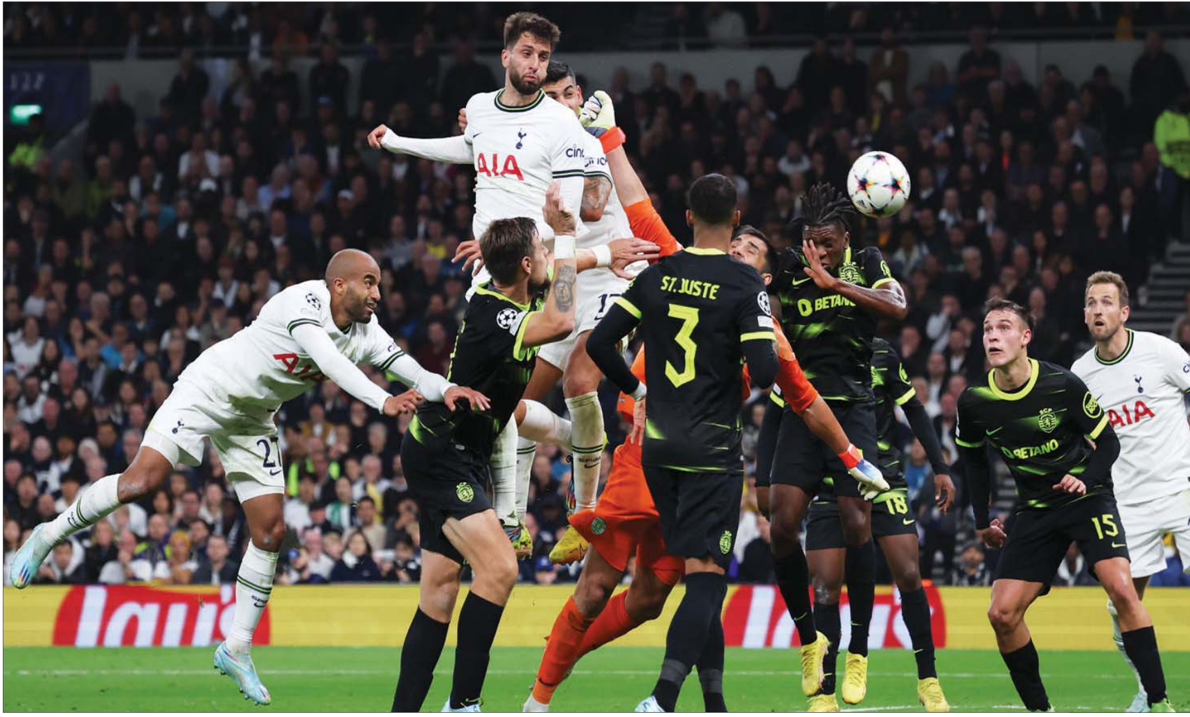
رأسية بينتانكور تهب شبك سبورتنغ لشبونة في دوري الأبطال

الحياة بينتانكور أن يتطور ويتحسن بسرعة، وأن الشجاعة هي خط الدفاع الحقيقي والوحيد ضد الشدائد والتحديات. قد يفسر كل هذا النضج الكبير الذي يتحلى به لاعب خط الوسط الأوروغوياني داخل المستطيل الأخضر، والجدية التي جعلته واحدا من أكثر لاعبي خط الوسط إثارة للإعجاب في الدوري الإنجليزي الممتاز. بل وربما أفضل لاعب في توتنهام هذا الموسم، مع الاعتزاز لهاري كين؛ وخلال معظم الأشهر التسعة التي قضاها في كرة القدم الإنجليزية، تمكن بينتانكور من القيام بواجباته بهدوء شديد بعيدا عن الأضواء. انتقل بينتانكور إلى توتنهام في نفس اليوم الذي وقع فيه ديان كولووسوفسكي للسبيرز في صفقة استحوذت على القدر الأكبر من الاهتمام، ويلعب في المنتخب الأوروغوياني مع نجوم من الطراز العالمي يخطفون منه الأضواء؛ مثل لويس سواريز وأديسون كافاني وفيدريكو فالفيدي، ولا يجرز أو يصنع الكثير من الأهداف، أو يمتلك مهارات فذة تجعل الجمهور يُعد مقاطع فيديو له على موقع يوتيوب مثل النجوم الآخرين الذين يبهرون عشاق كرة القدم بغفائهم الهائلة، وحتى الآن، غالبا ما تتجه الأنظار إلى شريكه الآخر في خط وسط توتنهام بيير إميل هويبيرغ، الذي لا يتوقف عن الركن داخل الملعب، ويبدو دائما متعرقا وكأنه رجز تطرده الكلاب. وبالتالي، يمكن لأولئك الذين لا يشاهدون المباريات بإمعان ألا يلاحظوا ما يقوم به بينتانكور، خاصة في خط وسط توتنهام الذي غالبا ما يبدو مرهقا ومضغوطة أمام الفرق المنافسة، وفي ظل اعتماد الفريق على الهجمات