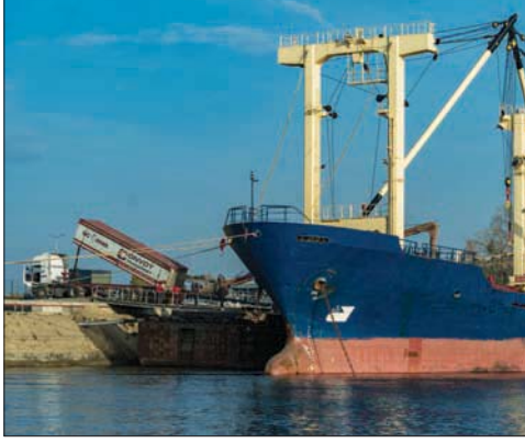
سفينة يتم تحميلها بالحبوب في أحد الموانئ الأوكرانية

أفكرة: سعيد عبد الرازق تعززت تركيا التقدم باقتراح لطراف الاتفاقية الرباعية الخاصة بإنشاء الممر الآمن لتصدير الحبوب في البحر الأسود لتمديد مدة عام في الوقت الذي عرضت فيه على روسيا استخدام مرافقها كمراكز لتخزين حبوبها. وقال وزير الدفاع التركي خلوصي أكار إن بلاده ستقدم بمقترح لتمديد اتفاقية الممر الآمن لتصدير الحبوب عبر البحر الأسود، الواقعة بين روسيا وأوكرانيا وتركيا والامم المتحدة في إسطنبول في 22 يوليو (تموز) الماضي والتي ينتهي العمل بها بتاريخ 19 نوفمبر (تشرين الثاني) الحالي، لمدة عام. وأضاف أكار أن مجلس الوزراء ناقش في اجتماع برئاسة الرئيس رجب طيب أردوغان، ليل الاثنين - الثلاثاء، استمرار الجهود لتمديد اتفاقية الحبوب، وأشار تركيا ستقرر تمديدتها لمدة عام. وأشار أكار إلى أن أوكرانيا قدمت ضمانات خفيفة لروسيا عبر تركيا، وبناء عليه وافقت موسكو على استخدام العمل بالاتفاقية بعد وفها الاثنين قبل الماضي،