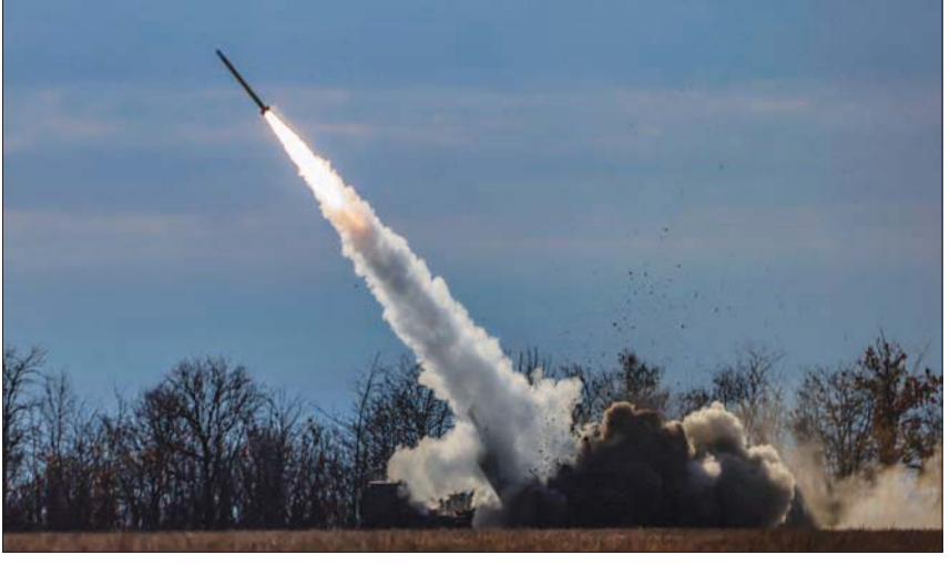
القوات الأوكرانية تطلق صواريخ هيمارس الأمريكية على خطوط جبهة الشمال