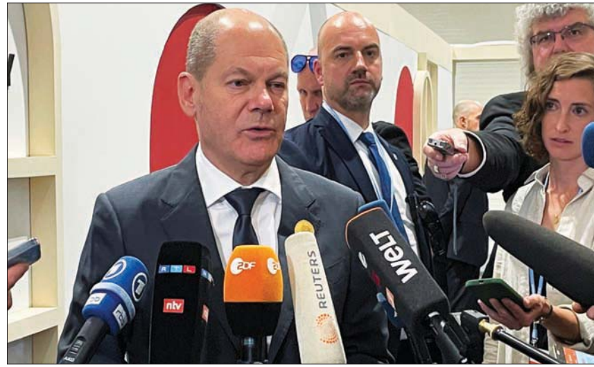
المستشار الألماني أولاف شولتس يتحدث للصحافيين في شرم الشيخ أمس

في ذلك قياستها وتسجيلها. ذلك إلى جانب مواجهة نقل الإنتاج إلى بلدان أخرى ذات معايير أكثر تراجيحاً في حماية المناخ، والتركيز على هدف تحول صديق للبيئة للصناعة. وعبر شراكات في مجال الطاقة تعزز دول مجموعة السبع مساعدة الدول الفقيرة في الانتقال إلى اقتصاد أكثر ملائمة للمناخ. يذكر أن مجموعة الدول الصناعية السبع الكبرى أيدت فكرة شولتس في نهاية يونيو (حزيران) الماضي، ووفقاً لورقة مفاوضات تم الإعلان عنها في قمة مجموعة السبع في ولاية بافاريا الألمانية في ذلك الوقت، فإن الهدف من نادي المناخ هو تقليل الانبعاثات غازات الاحتباس الحراري، بما