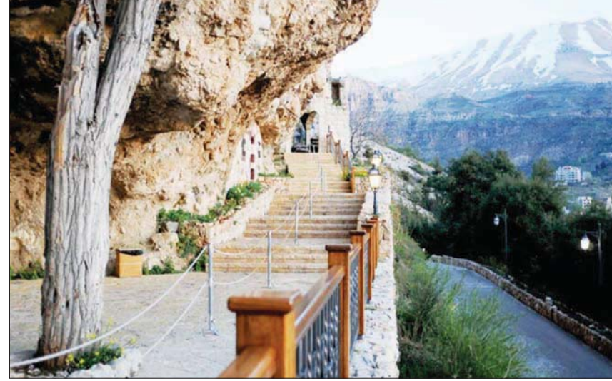
مدخل المتحف (الشرق الأوسط)

لا يزال جبران الأديب الثالث الأكثر قراءة عالمياً، الأول هو شكسبير، والثاني هو الحكيم الصيني لائوتزه، أما الثالث فهو كتابه الشهير «النبى» لغاية الآن إلى 130 لغة في العالم، ولكل لغة العديد من الترجمات، فهو مترجم إلى الألمانية في 17 ترجمة مختلفة، وإلى الفرنسية بعشرين ترجمة، وإلى الصينية في حوالي 6 ترجمات. لهذا فقد كانت سفارات أجنبية قد أولت متحف جبران عناية خاصة، مثل السفارة اليابانية في بيروت التي قدمت منحة في الفترة الأخيرة، كما السفارة البلغارية التي أعادت تاهيل مكتبة الديب الشخصية. يبقى أن العناية العربية، بمتحف أديب لبناني وعربي، لها أهمية خاصة، وتكتسب معنى مختلفاً.