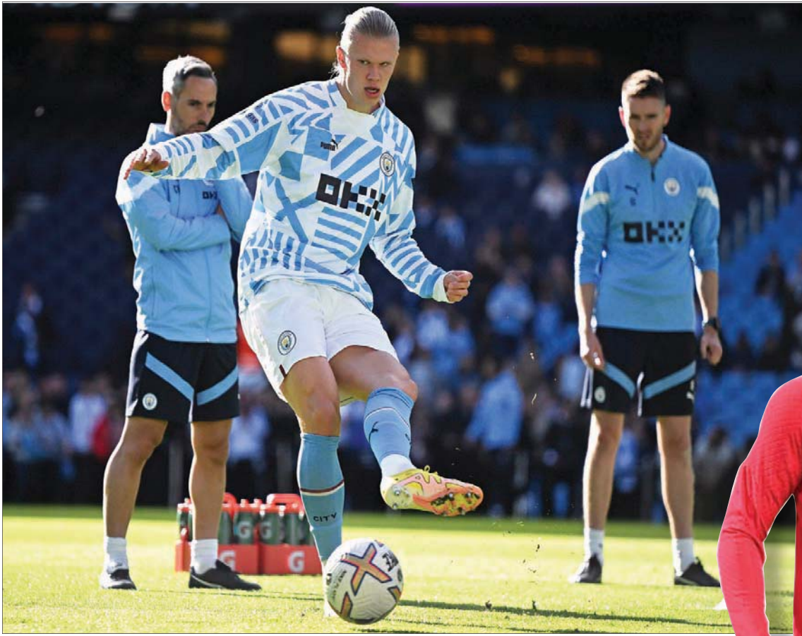
هالاند عملاق سيتي ومصدر الخطر على دفاع تشيلسي في مواجهة كأس الرابطة

لندن، هاني عبد السلام تبرز مواجهة القمه بين مانشستر سيتي وتشيلسي اليوم في الجولة الثالثة لكأس رابطة المحترفين الإنجليزية التي تشهد عدة صدامات بين فرق الدرجة الممتازة منها لقاء أرسنال متصدر الدوري مع برايتون، ونيوكاسل «المنتشي» مع كريستال بالاس، وليفربول مع ديربي كاويتي، فيما سيكون مانشستر يونايتد مدعو للقاء ناري ضد أستون فيلا في ختام الجولة غدا. ويخوض تشيلسي إلى ملعب «الاتحاد» لمواجهة سيتي وهو يدرك أن المهمة ثقيلة أمام فريق المدرب الإسباني جوسيب غوارديولا المهاجم النرويجي العملاق إرلينغ هالاند. وخاض تشيلسي بقيادة المدرب غراهام پوتير تسع مباريات دون هزيمة بعد خسارة المدير الفني الألماني توماس توخيل في سبتمبر (أيلول)، لكنه وجد نفسه في أزمة الآن بعد أربع مباريات دون فوز في الدوري ليتراجع للمركز السابع. وعبرت جماهير تشيلسي عن استيائها عقب الخسارة 1 - صفر من أرسنال في قمة ستامفورد بريدج يوم الأحد، لذا يحتاج پوتير لاستعادة لسانته السحرية سريعا عند زيارة ملعب سيتي في كأس الرابطة وقيل الانتقال لمواجهة نيوكاسل يونايتد ثالث الترتيب في آخر مباراة قبل التوقف بسبب كأس العالم. واعترف پوتير بقسوة مرارة الهزيمة أمام أرسنال، وأن فريقه ليس في أحسن حال، لذلك طالب اللاعبين بالثقل وإظهار وجه مختلف في مواجهة سيتي. وعلى پوتير البحث عن حلول لآزمة خط هجومه بعد أداء متواضع للمهاجمين بيير إيميريك أوباميانغ أمام فريقه السابق. في المقابل يواصل سيتي مطاردته لأرسنال على صدارة