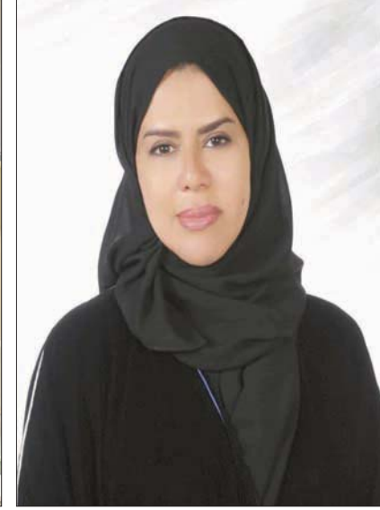
سامية الفوز (الشرق الأوسط)

الرياضية للجامعات السعودية بنظم البطولات ويرشح نخبة منتخب الجامعات والمشاركات السعوديات من الطالبات والطلاب للمشاركة في البطولات الخارجية والدولية، مثل بطولة الكاراتيه للجامعات العالمية التي «مطلنا فيها جامعة الإمام عبد الرحمن بن فيصل وحصلت على الميدالية الذهبية، كما أن جامعة الملك سعود حازت على الميدالية الفضية، وكنا نخطط لبطولة كرة قدم للصالات للطالبات، ولكن لم تتم بسبب عدم جاهزية المنتخب وبعض الجامعات في الصيف الماضي، لذلك نحن نحفز