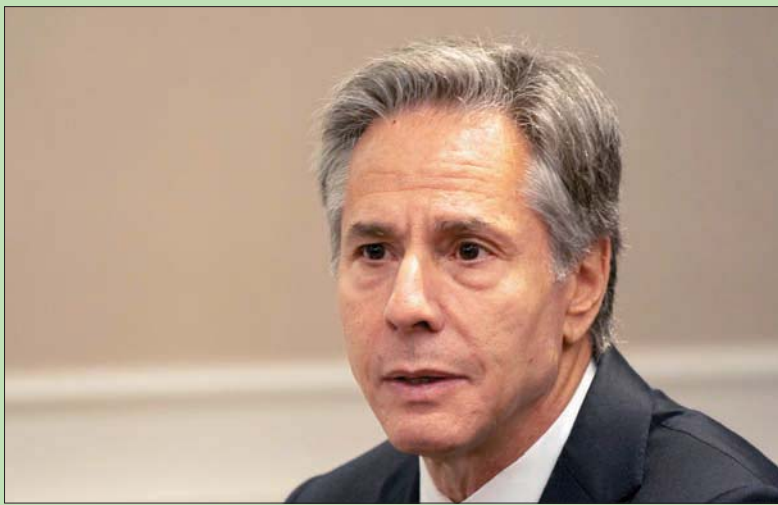
انتوني بليكن

معبرين عن «قلقهم العميق من الخطاب الذي يهدد عمداً المفاوضات والإجراءات التي تعيق الاستقرار الاقتصادي في اليمن». ودعوا المتحد، والعودة إلى الإنخراط مع في المفاوضات تحت رعاية الأمم المتحدة، والعمل بشكل عاجل من أجل تمديد الهدنة وإقرار توسيعها». وكرروا المطالبة بـ«تجنب استئناف الأعمال العدائية داخل اليمن، وكذلك الهجمات داخل المنطقة وعلى البحر الأحمر»، مؤكداً أن «مجلس الأمن سيواصل اتخاذ كل الإجراءات لدعم جهود السلام والأمن والاستقرار في اليمن».