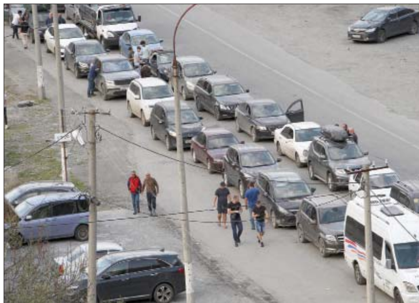
سيارات روسية على المعبر الحدودي بين روسيا وفنلندا

ممتلكاتهم، تلك النتيجة تحولت الطوابير الطويلة إلى سيارات مهجورة على طول الطرق المؤدية إلى المعابر الحدودية. وذكرت تقارير إخبارية أن السلطات المحلية واجهت مشكلة عويصة بسبب انتشار ظاهرة «المحور» من طراز آخر في روسيا، قد تغدو ضحيتها سيارات الهاربين من خدمة وطنهم على الجبهة. أحدث الأفكار التي برزت لدى المشرعين الروس، وهم يبحثون عن وسائل معاقبة الفارين من التعبئة العسكرية، وكبح رغبات آخرين تقطعت بهم سبل الهروب من البلاد بعد تشديد الإجراءات الأمنية على المعابر الحدودية، تمثلت في مصادرة من السيارات المتروكة لسلطات المرور في المنطقة. وهذا يعني أن أصحاب تلك السيارات تراكمت عليهم فواتير ضخمة وهم غائبون عن البلاد.