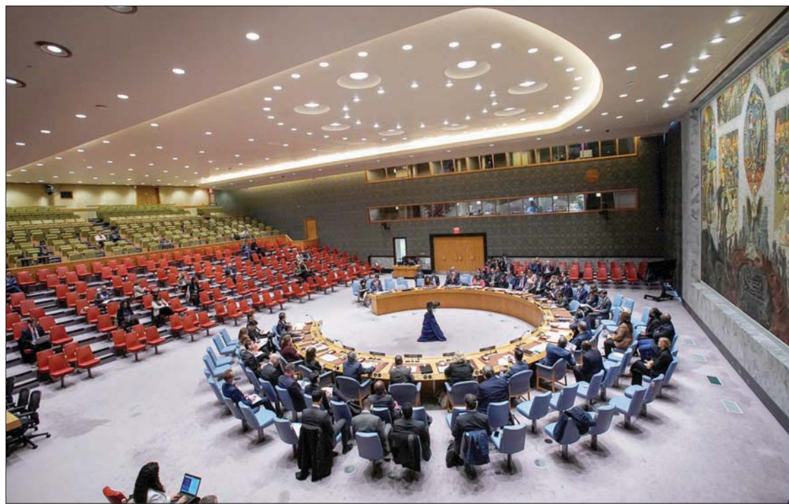
من جلسة مجلس الأمن الأخيرة