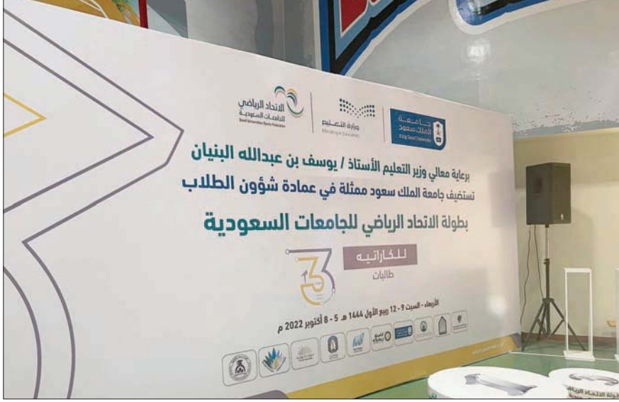
إعلان انطلاق جوائز كاراتيه الجامعات (الشرق الأوسط)