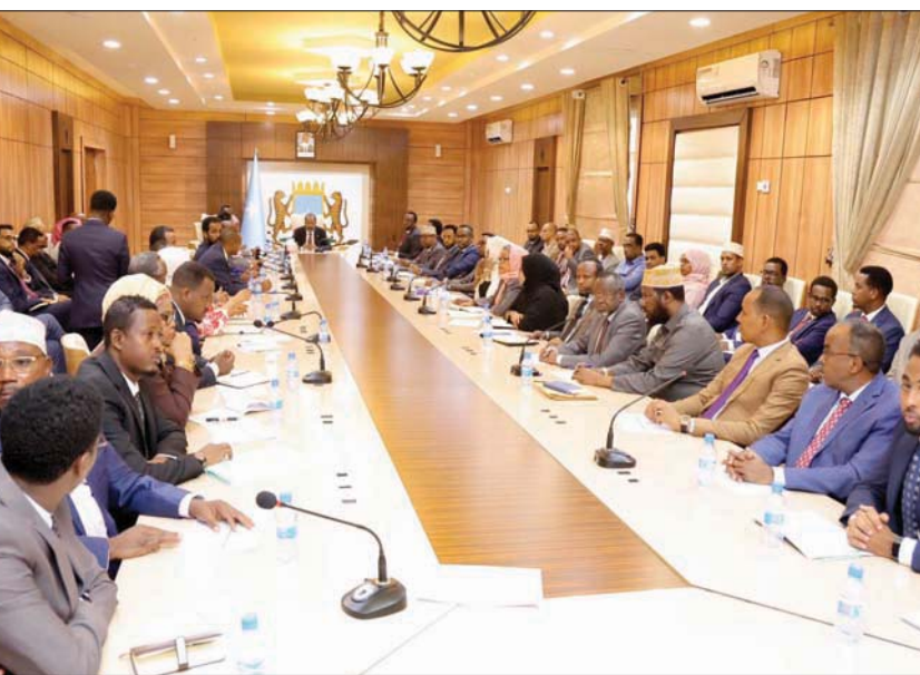
صورة بثها مكتب الرئيس الصومالي على «تويتر» لاجتماع مع الحكومة

تحت سيطرة عناصر الحركة. وناقش الرئيس الصومالي حسن شيخ محمود، في اجتماع مع حمزة عبيدي بري، رئيس الحكومة ووزرائها خطة الطوارئ والتنمية والاستقرار في المناطق المحررة من الإرهاب. في غضون ذلك، دعا علي جيتي حاكم منطقة حيران الصومالية إلى اتخاذ إجراءات حازمة ضد رؤساء الشرطة والمخابرات في المنطقة الذين