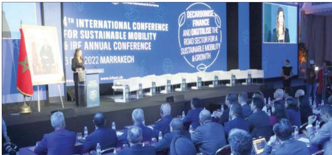
جانب من مؤتمر دولي عقد في مراكش حول قطاع النقل (الشرق الأوسط)

هذا الملتقى المهم، تسليط الضوء على آخر المستجدات والتطورات في مجال السلامة الطرقية والنقل المستدام». وينتظر أن يتمخض عن المؤتمر إصدار تقرير تركيبي سيتم توجيهه إلى الدورة المقبلة لمؤتمر الأطراف حول تغير المناخ «كوب 27».