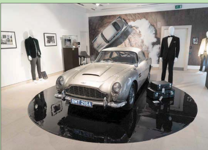
«أستون مارتن» التي ظهرت في فيلم «نو تايم تو داي» حققت 3,3 مليون دولار في المزاد