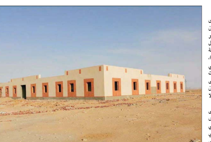
تجمع بدوي بشمال سيناء

الدولة تهدف إلى تعزيز التنمية الاجتماعية والاقتصادية ودمج أسر الفوضى المصري». وأشارت الوزيرة إلى «صرف مساعدات نقدية لنحو 5540 الأسر الأولى بالرعاية والمساكين والسائقين المضارين من عمليات مكافحة الإرهاب، ومن النقل المناطق أخرى، تجاوزت 53 مليون جنيه، إضافة إلى صرف تعويضات لنحو 2143 مصاب، و742 من أسر الشهداء للمتضررين من المواجهات الأمنية بين قوات إنفاذ القانون والعناصر الإرهابية تصل إلى نحو 196 مليون جنيه، وصرفت تعويضات مبان 1815 أسرة نتيجة أحداث إرهابية مبلغ يقرب من 12 مليار جنيه، كما تم سداد متأخرات التأمينات الاجتماعية المستحقة عن 670 من المصابين المضارين من وقف عمليات الصيد وقت مكافحة العمليات الإرهابية». على صعيد متصل، أكد الرئيس المصري عبد الفتاح السيسي، في منشور على صفحته الرسمية على مواقع التواصل الاجتماعي، أمس، «حرب أكتوبر المجيدة ستظل نقطة تحول في تاريخ مصر المعاصر، حيث استردت القوات المسلحة شرف الوطن وكبرياءه، ومحت وصمة الإحتلال عن أراضينا». ووجهها الحية للشعب المصري وللجيش، «لشجاعتهم وبطولاتهم»، وأرسل الرئيس المصري تحية سلام إلى «روح بطل الحرب والسلام، الرئيس الراحل أنور السادات، الذي خاض الحرب وثاقاً بالله وعزيمة بني وطنه، ليحقق نصراً عظيماً منطلقاً خضراء، مخصصة للقطاع الخاص والمجتمع المدني وتضم مساحة المعارض ومسرحاً وقرغاً للاجتماعات ومساحة للمجتمع المحلي البدوي». وفي سياق متصل لفت نبين النجاج، وزيرة التضامن الاجتماعي المصرية، إلى جهود الوزارة في تنمية محافظة شمال سيناء، وقالت، في بيان صحفي، أمس، إن