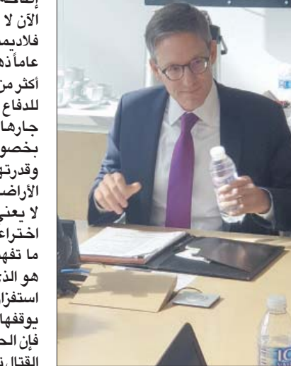
مستشار وزارة الخارجية الأميركية ديريك شوليت (الشرق الأوسط)

التي ستواجهها روسيا في حال استخدام «النووي»، قائلاً: «إنه (الرئيس الروسي) يعرف معرفة جيدة ماذا سيكون الرد. بوتين «يعرف ما هي العواقب الوخيمة» التي ستواجهها بلاده لو لجأت لهذا النوع من الأسلحة. وكشف في الوقت ذاته عن أن الولايات المتحدة لا تلحظ أي تغييرات في منظومة نشر الأسلحة النووية الروسية بشكل يوحي بأن هناك استخداماً وشيكاً لها، علماً بأن موسكو نفت في الأيام الماضية الكلام عن إمكان استخدامها هذا السلاح رغم الانتكاسات المتلاحقة التي تواجهها قواتها في أوكرانيا. وقال إن «سياستنا تجاه أوكرانيا تقوم على 3 محاور: أولاً: دعم أوكرانيا، ولقد قدمنا على الأقل أكثر من 17 مليار دولار مساعدات عسكرية، وهذا أكثر بثلاثة أضعاف من موازنة الدفاع الأوكرانية كلها لعام 2021. ووفق ذلك، قدمت الولايات المتحدة 9 مليارات دولار مساعدات إنسانية وإنمائية. لسنا لوحيدنا، هناك نحو 50 دولة تساهم في تقديم المساعدات الأوكرانية للدفاع عن نفسها. المحور الثاني هو تعزيز حلف (الناتو). قلنا مراراً إننا سندافع عن كل شبر من أراضي (الناتو)، وهذا يشمل نشر قواتنا العسكرية. لدينا اليوم في أوروبا من الجنود أكثر مما كان لدينا قبل عام مضى. ونحن نعمل أيضاً مع حلفائنا وشركائنا لضمان أنهم أيضاً يساهمون في الدفاع عن حلف (الناتو) على الجبهتين الشرقية والجنوبية. أما المحور الثالث؛ فهو عمل دول روسيا ومعاقبتها». وسُئل عن موقف أميركا من إمكان إطلاق أوكرانيا هجوماً لاستعادة شبه جزيرة القرم التي ضمتها روسيا عام 2014، فأجاب: «لا نريد أن نكون الأوكرانيين من الأوكرانيين أنفسهم؛ ولا أقل أو أكثر من