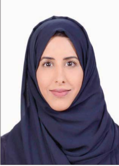
مزة المرزوقي (الشرق الأوسط)

وواصلت حديثها: «الإقبال من قبل الطالبات المشاركات كبير جداً ويجرّصن على ممارسة رياضتهن المفضلة قبل البدء في دروسهن، وهذا يدل على وعي وفهمهم