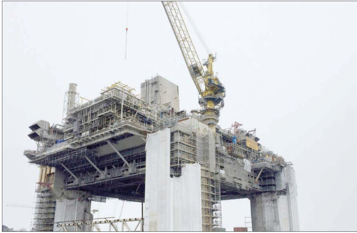
استقرت أسعار النفط أمس حول أعلى مستوى في 3 أشهر

الغربية سقفاً على أسعار الطاقة الروسية بسبب الغزو الروسي لأوكرانيا. وأشارت أعضاؤ المجموعة لدعوى قضائية مرتبطة بمكافحة الاحتكار. وفي سياق منفصل قال نائب رئيس الوزراء الروسي الكسندر نوفاك، مساء الأربعاء، إن روسيا قد تخفض إنتاج النفط، في محاولة لمواجهة تداعيات فرض