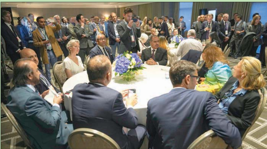
جانب من حفل استقبال مجلس السفراء العرب (سفارة البحرين)

منوهاً بالثقة السياسية المتبادلة بين الدول العربية وبريطانيا، مؤكداً حرص مجلس السفراء العرب على تطوير العلاقات بما يعزز توثيق أواصر التعاون وترسيخه في قطاعات السياحة والتكنولوجيا والطاقة والاستثمار. كما أعرب عن تطلع دول مجلس التعاون لدول الخليج العربية إلى إتمام اتفاقية التجارة الحرة الخليجية البريطانية.