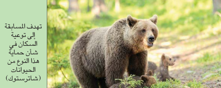
تهدف المسابقة إلى توعية السكان في شأن حماية هذا النوع من الحيوانات (شاترستوك)

التي تعيش خارج بلدها بسبب الغزو الروسي لمقطوعات فرنسية واوكرانية. وقاد الأوركسترا الأوكرانية التي تضم نحو 40 موسيقياً خلال الحفلة التي أقيمت في دار باريس الفيلهارمونية الإيطالية لويجي وتخطت نتائج هذه المزادات التي انتهت، الأربعاء، إجمالي إيرادات المزادات الخيرية السابقة المرتبطة بعالم جيمس بوند من تنظيم دار كريستيز، على ما أعلنت دار المزادات. وقد وجدت كامل القطع الـ 61 المبعة من شركة «ايون بروكسكينز» المنتجة لأفلام جيمس بوند، من يشترها خلال هذا المزاد الذي أقيم احتفالاً بذكرى مرور ستين عاماً على انطلاق هذه السلسلة تحدثت نتائج هذه المزادات التي انتهت، الأربعاء، إجمالي إيرادات المزادات الخيرية السابقة المرتبطة بعالم جيمس بوند من تنظيم دار كريستيز، على ما أعلنت دار المزادات. وقد وجدت كامل القطع الـ 61 المبعة من شركة «ايون بروكسكينز» المنتجة لأفلام جيمس بوند، من يشترها خلال هذا المزاد الذي أقيم احتفالاً بذكرى مرور ستين عاماً على انطلاق هذه السلسلة