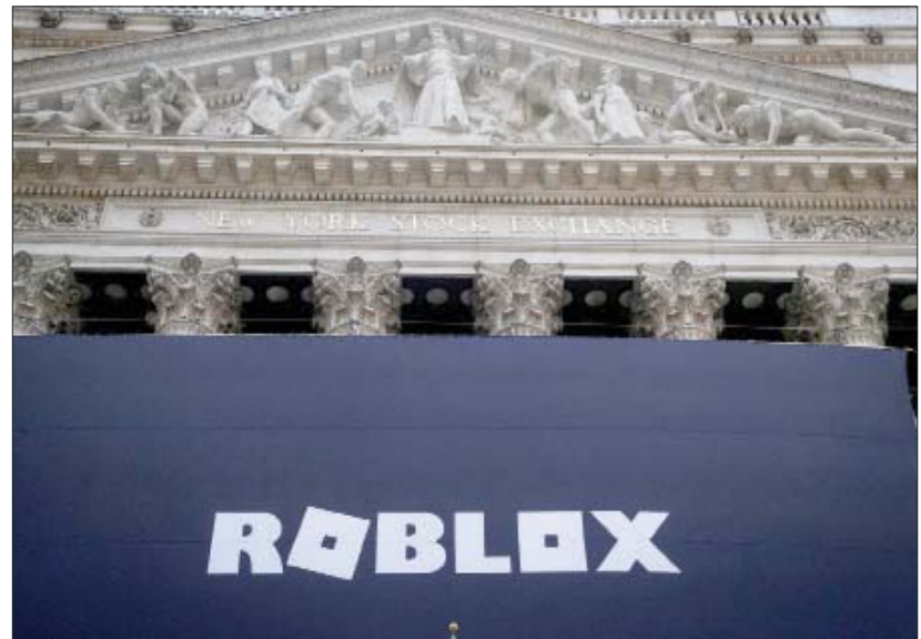
ارتفعت أغلب الأسواق بينما يتقرب المستثمرون ببيانات هامة

وافق في أغسطس (آب) الماضي مجلس الوزراء السعودي على إنشاء هيئة مستقلة لتشجيع الاستثمار في البلاد في إطار برنامج طموح للإصلاح الاقتصادي.