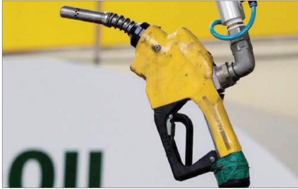
تظهر الحسابات البسيطة أن النفط ربما يكون الأقل تقلباً أو شططاً بين السلع الأساسية أو غيرها المقارنة عالمياً على مدار السنوات

أسعاراً «خيالية» لتوريد الغاز من أجل تعويض وقف الشحنات الروسية. حتى اتهامات «تسييس المنظمة والتحالف»، دائماً ما نفتها كل الأطراف الفاعلة في «أوبك» عبر وزراء ومسؤولين رفيعي المستوى، أكدوا في كل المناسبات، وأحدتها يوم الأربعاء، أن دوافع المنظمة ومحركاتها «اقتصادية لا سياسية». ومع تنوع الانتقادات وديمومتها، كان لا بد من البحث عن واقعية السعر العادل للنفط. وفي المؤتمر الصحافي عقب اجتماع فيينا، سعى الأمير عبد العزيز بن سلمان وزير الطاقة السعودي لتوضيح الوضع في أسواق النفط، فأكد أن أسعار النفط ارتفعت أقل بكثير من سلع الطاقة الأخرى مثل الغاز والفحم، مستعيناً بجدول أسعار.