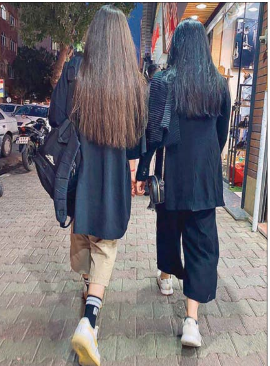
نساء من دون حجاب بطهران

وجاء اللقاء غداة بيان صادر من الأساتذة أعلنوا عن عزيمتهم المشاركة في وقفة احتجاجية السبت المقبل، للتذيدة باقتحام الجامعة من قوات الأمن واعتقال الطلاب المحتجين السبت الماضي. وأدان بيان الأساتذة بشدة أعمال العنف، وتعرض الأساتذة الطلبة من قبل أفراد يرتدون ملابس مدنية، وقال الأساتذة: «ما حدث في الجامعة يوم الحداد لجامعة شريف»، وإذ أعلن الأساتذة عن تضامنهم الكامل مع الطلاب، طالبوا كبار المسؤولين بتقديم اعتذار رسمي.