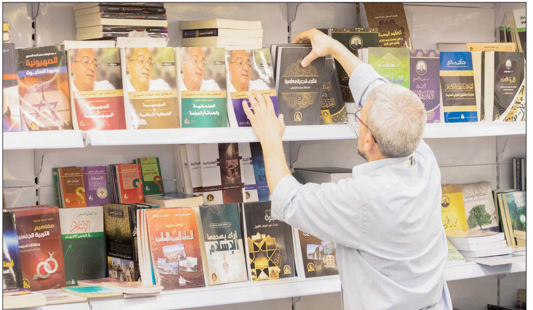
عارض يرتب منشوراته في رفوف جناحه في معرض الكتاب بالرياض