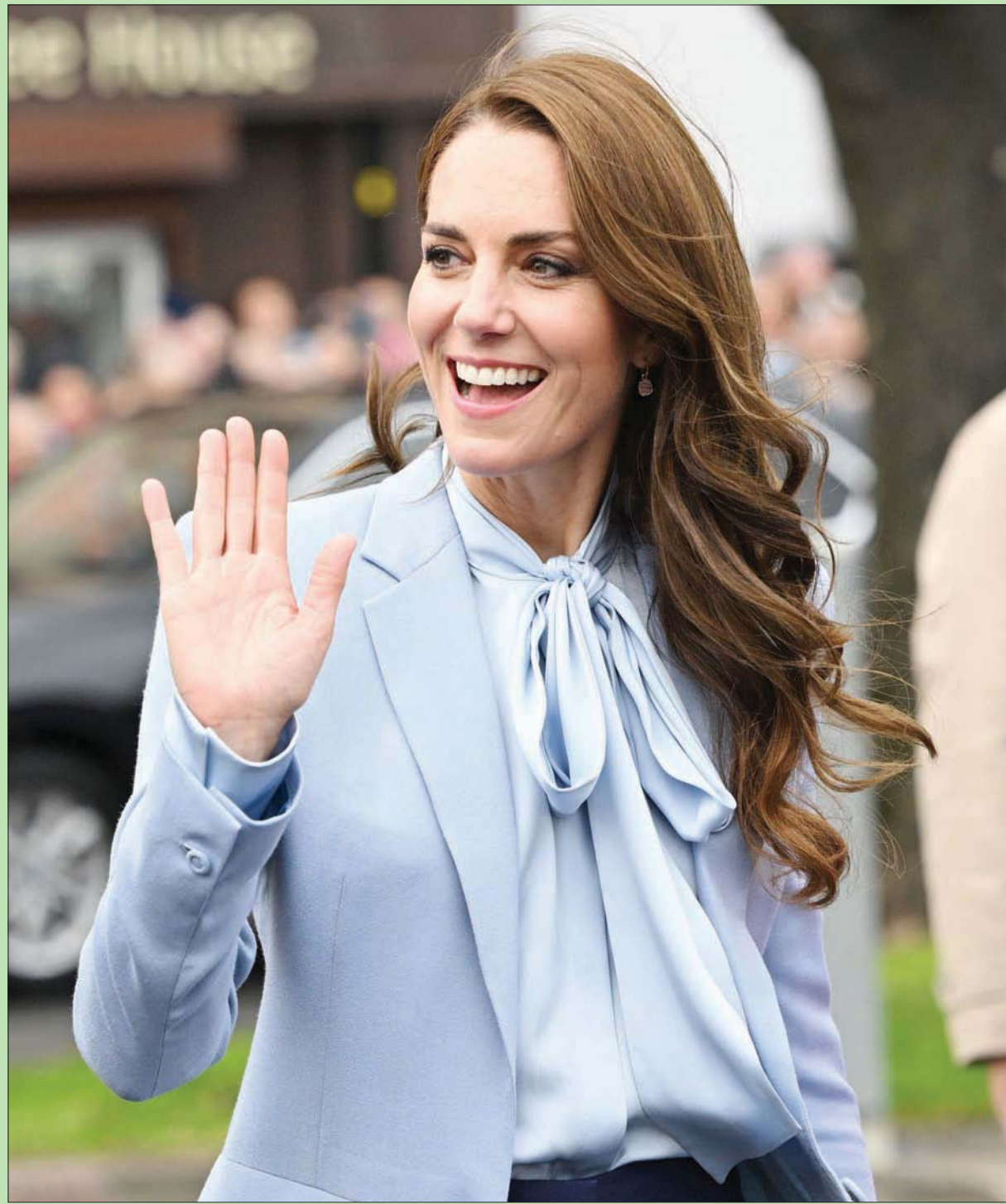
كيت أميرة ويلز لدى زيارتها آيرلندا الشمالية

هل ينتفع أهل العراق أو إيران أو لبنان أو اليمن من استفحال الاحتراب الأهلي بين الناس، وهل يغضب ذلك العظماء الفضلاء على والحسين؟