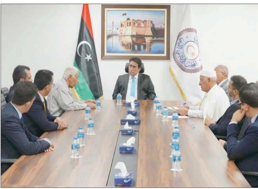
صورة وزعها المجلس الرئاسي الليبي لاجتماع رئيسه المنفي بوفدة برقة

عودة الأمانة للشعب، والبدء في الاستعدادات اللوجيستية والتنظيمية، وفقاً لما هو ثابت في القوانين الانتخابية، وتاجيل ما يتوقع تغييره بحسب القانون لوقت لاحق، واستعداد الحكومة التام لذلك.