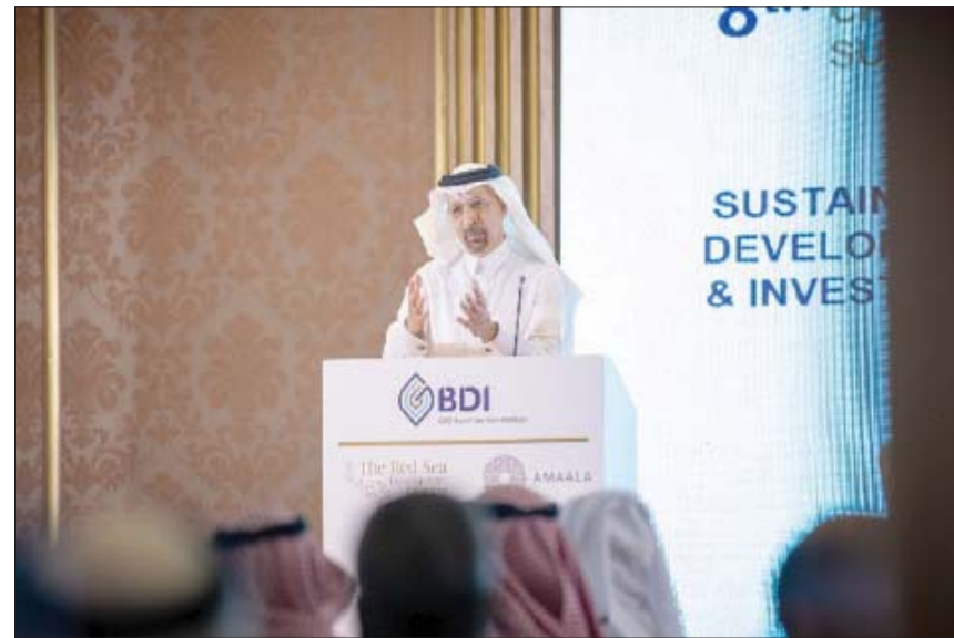
جانب من ملتقى «رؤيتي السعودية - اليابان 2030» الذي انعقد أمس في العاصمة طوكيو (الشرق الأوسط)