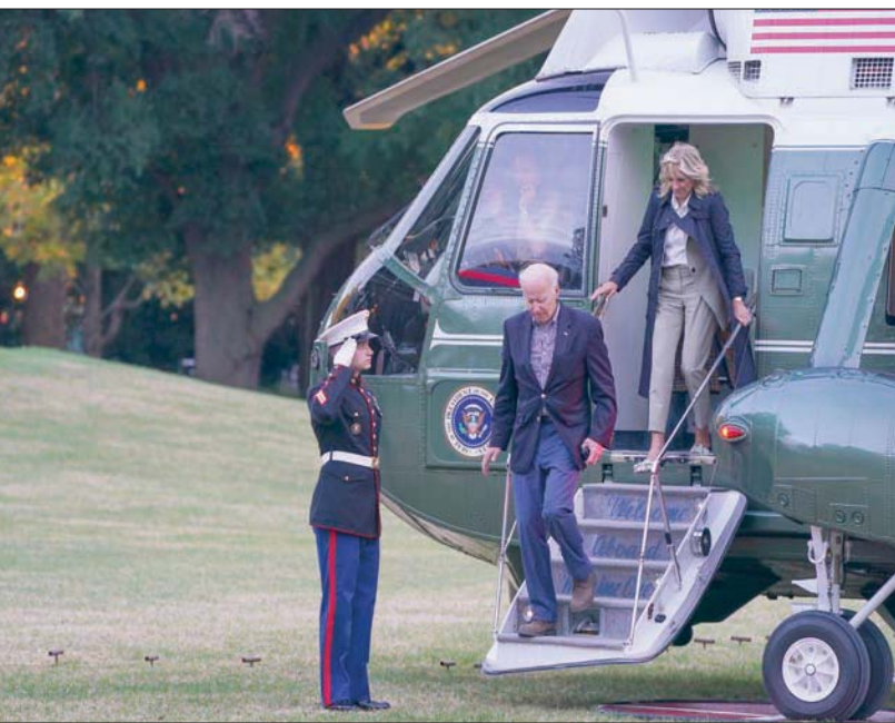
بايدن وزوجته جيل لحظة عودتهما من جولة على المناطق التي ضربها الإعصار «أيان»

الأميركي عن قلقه من قرار «أوبك بلس»، ينظر الديمقراطيون بقلق أكبر إلى ارتفاع الأسعار في ولايات متارجحة سوف تحسم السباق. ففي ولاية كاليفورنيا مثلاً التي تشهد سباقات حامية على أسعار النفط إلى معدلات لم تشهد الولاية من قبل، الأمر الذي استغله الجمهوريون لصالحهم في الحملات الانتخابية. كما شهدت ولايات متارجحة منها نيفادا وأريزونا وأوهايو ارتفاعاً ملحوظاً في الأسعار. تحدث عنه كينيث بوك مدير شركة الأبحاث «كلير فيو» للطاقة قائلاً لشبكة «بلومبرغ»: «الأسعار المرتفعة هي خبر سيئ للديمقراطيين، وهي لم تساعد شعبية الرئيس، ولن تساعد حربه في الانتخابات». وبسبب هذا واضحاً في تصريحات الديمقراطيين المرتبكين، خصوصاً في الولايات التي ستحسم مصيرهم في الكونغرس الـ117 الاقتصادي على حيث تحدث السيناتور الديمقراطي رافاييل وورنك الذي يناقش المرشح الجمهوري هيرشل واكر على مقعده، عن أسعار البنزين قائلاً: «أود أن أرى الأسعار تنخفض أكثر، لهذا سوف أستمع مفاجئ على لتجديد الضرائب الفدرالية على النفط حتى شهر يناير (كانون الثاني)،