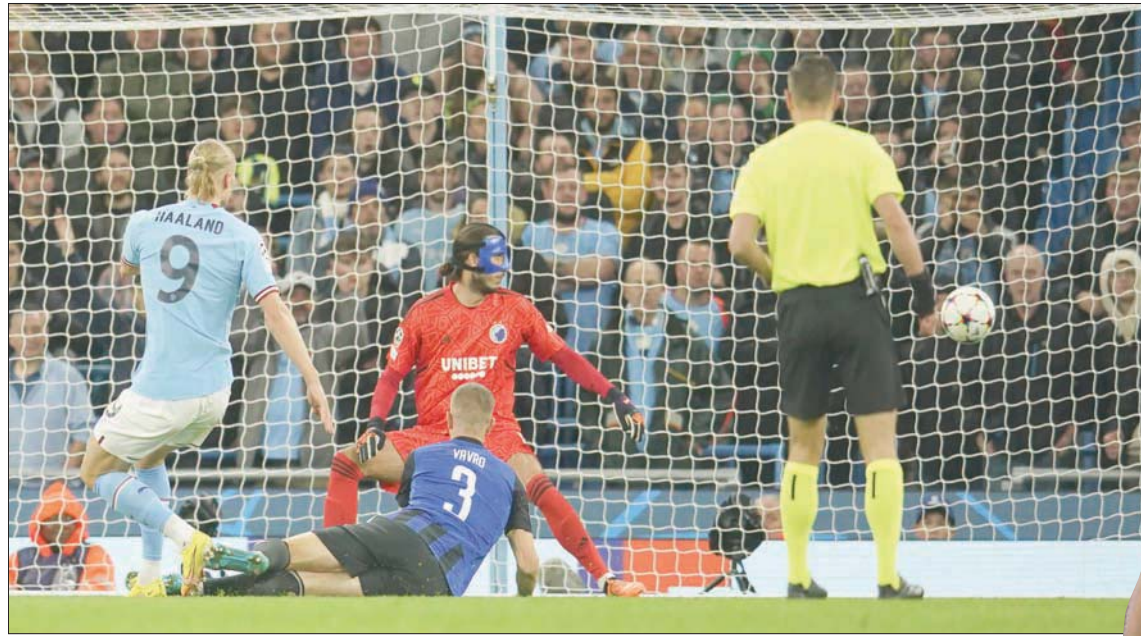
هالاند (رقم 9) هدف سيتي يفتتح خماسية فريقه في مرعى كوينهاغن

ويلتقي النادي الملكي مجدداً مع شاخترن الأسبوع المقبل في وارسو، في مباراة أكد الألماني توني كروس نجم الريال رغبة فريقه في حسمها لتأمين تأهله إلى دور الستة عشرة. وقال كروس «الفكرة تتلخص في ضرورة حسم تأهلنا عن دور المجموعات في أقرب وقت، لدينا