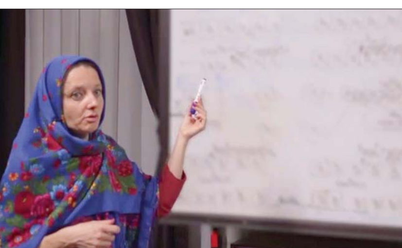
الفرنسية سيسيل كوهلر تقف أمام لوحة في فيديو بثته قناة «العالم» الإيرانية أمس

التوتر القائم في العلاقات الفرنسية - الإيرانية، من جهة؛ على خلفية الانتقادات الحادة التي وجهتها باريس للسلطات الإيرانية الضالعة في عمليات قمع واسعة منذ 16 سبتمبر (أيلول) الماضي للاحتجاجات التي اندلعت عقب وفاة الشابة مهسا أميني بعد احتجازها 3 أيام بمقر للشرطة في طهران؛ ومن جهة ثانية، بسبب تحميل باريس الجناح الإيراني مسؤولية وصول الملف النووي إلى طريق مسدود، وفي خطاب ناري ألقته في مجلس الشيوخ ليل أول من أمس، اتهمت وزيرة الخارجية، كاترين كولونا، إيران بأنها تسعى إلى «خنق صوت الحرية بالجوء إلى الرقابة والعنف»، مشيرة إلى أن عدد ضحاياها وصل إلى مائة قتيل فيما اعتقل ما يزيد على الألف، وذكرت بأن باريس دعت طهران إلى «احترام حق الظاهر والسلمي، وحق التجمع، واحترام حق الصحافيين في ممارسة عملهم الصحافي»، مذكرة بأن فرنسا أدانت «بأسد العبارات» منذ 19 من الشهر الماضي «عنف السلطات الأعمى» والرجال الذين يستهدف النساء والرجال الذين يتظاهرون من أجل كرامتهم وحقوقهم». وكشفت كولونا أنها طلبت استدعاء القائم بالأعمال الإيراني في باريس لينقل موقف فرنسا من التطورات في إيران؛ وتحديداً من «العنف». وأكدت كولونا أن باريس «تحقق في المقدمة» وتعمل مع شركائها في الاتحاد الأوروبي لفرض عقوبات على المسؤولين عن القمع، أملة في أن يتم ذلك خلال الأيام العشرة المقبلة؛ في إشارة إلى اجتماع وزراء الخارجية الأوروبيين في 17 أكتوبر (تشرين الأول) الحالي.