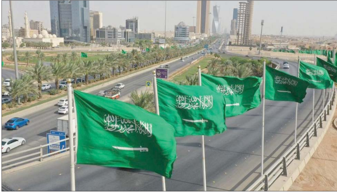
صندوق الاستثمارات العامة السعودي يسعى لزيادة تفعيل دوره في المبادئ البيئية والاجتماعية (الشرق الأوسط)

ووصل المجموع الكلي لطبقات الاكتتاب أكثر من 24 مليار دولار، كما تجاوزت نسبة التغطية أكثر من 8 أضعاف إجمالي الإصدار مقسمة على عدة شرائح، الأولى بقيمة 1,25 مليار دولار لسندات مدتها 10 أعوام، والثانية بقيمة 1,25 مليار دولار لسندات مدتها 25 أعوام، والثالثة بقيمة 500 مليون دولار لمدة 100 عام.