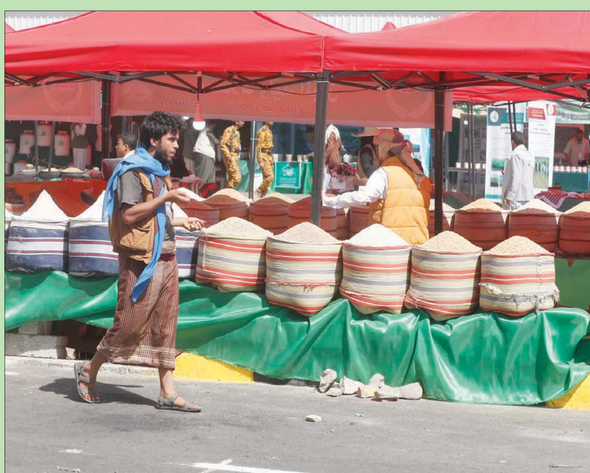
ارتفاع أسعار المواد الغذائية يضاعف مصاعب اليمنيين (إبأ)

وشدّدت البعثة على الحاجة إلى النهوض، بدرجة أكبر، بمستوى الشفافية والمساءلة عن توظيف الموارد العامة الشحيحة، الأمر الذي من شأنه أن يساعد في الحد من مواطن الضعف التي تُفضي إلى التّعرض للفساد، والمساعدة في نهاية المطاف في حفز التمويل الإضافي من المانحين. وقالت إنه، وعلى وجه التحديد، فإن استمرار عمليات إصلاح الإدارة الضريبية وإدارة المالية العامة على نطاق واسع، بما في ذلك تعزيز عمليات التدقيق الضريبي، وزيادة استخدام التكنولوجيا الرقمية، وتحسين إدارة الدين العام، وتنفيذ النظام المتكامل لمعلومات الإدارة المالية (إفميس)، «من شأنه أن يدعم، على نحو أفضل، عمليات وزارة المالية في مجال التخطيط للموازنة، وتنفيذ الموازنة، والإبلاغ».