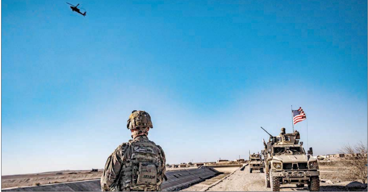
مروحية هجومية أبانتشي فوق جنود أميركيين يقومون بدوريات في ريف تل تمر شمال شرقي سوريا ديسمبر 2021

وقال مصدران أمنيان، لـ«رويترز»، في وقت لاحق، إن القتيل قيادي في التنظيم ومطلوب من الولايات المتحدة. وقال أحد المصادر الأمنية إن «العملية المحمولة جواً استهدفت قيادياً بارزاً في تنظيم داعش، موجوداً في منطقة تسيطر عليها الحكومة السورية، وكُلت العملية بالنجاح». وأضاف المصدر أن