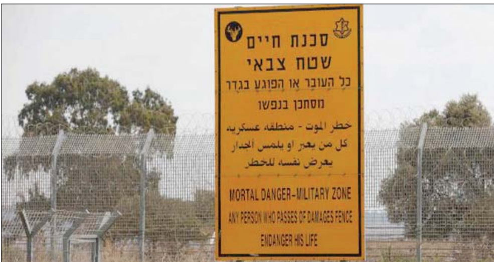
لافتة تحذر من الاقتراب من المنطقة عسكرية إسرائيلية بالجولان المحتل

وخزعت المخابرات باستنتاج، أنهم يعملون في خدمة عصابات تجارة أسلحة. ولكنها لم تستبعد أن يسافر التحقيق عن وجود علاقة للشباب الثلاثة والتنظيمات المسلحة الفلسطينية والسورية واللبنانية وأن تكون قد دفعت بهم إلى المنطقة.