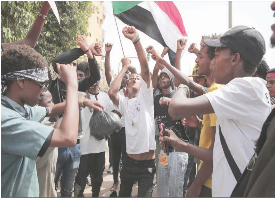
سودانيون يتظاهرون في أحد شوارع الخرطوم أثناء الاحتجاجات