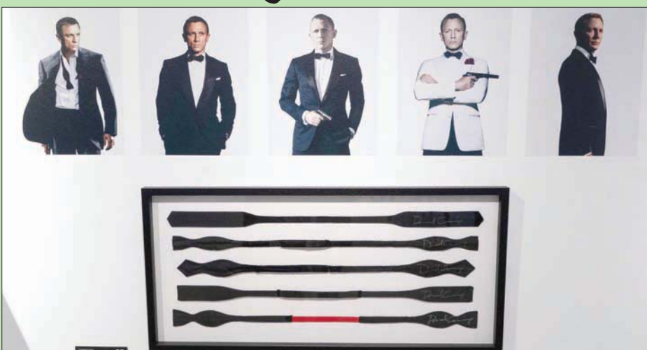
مجموعة من ربطات العنق (بايبون) ارتداها دانيال كريغ في أفلام جيمس بوند التي بيعت في المزاد