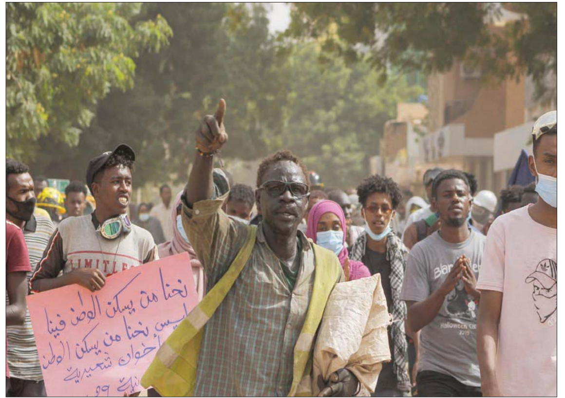
سودانيون يشاركون في مسيرة بالخرطوم للمطالبة بعودة الحكم المدني سبتمبر الماضي

أيام المواقب اللامركزية، أو حين تغلق السلطات الجسور الرابطة بين مدن العاصمة الخرطوم. وأغلقت السلطات - كالعادة كلما أعلنت موابك احتجاجية - جسر «الملك نمر» الرابط بين الخرطوم ومدينة الخرطوم بحري، ويمر بالقرب من القصر الرئاسي والمناطق الحيوية في قلب الخرطوم، باستخدام الحاويات المعدنية لمنع مرور السيارات والراجلة عبره، وخرج الآلاف في موابك احتجاجية في مدن: «الأبيض» في كردفان، و«السجى» في دارفور، و«ود مدني» في الجزيرة، ومدن أخرى في أنحاء البلاد.