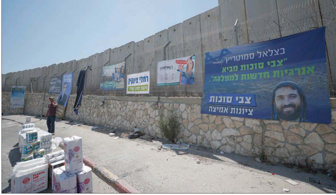
بانع فلسطيني بجانب لافتة حملة انتخابية لحزب تكوما اليميني بالقرب من قرية حمزة شمال القدس

وفي هذه الحالة، يفوز معسكر اليمين المتطرف بقيادة رئيس المعارضة بنيامين نتينياهو بأكثرية مطلقة (64 من مجموع 120 مقعداً)، فيما سينخفض تمثيل معسكر الائتلاف الحالي، بقيادة رئيس الوزراء يائير لبيد، من 62 في الانتخابات الأخيرة إلى 56 مقعداً. أجري هذا الاستطلاع في معهد «ماغار موحوت» (مخزن العقول)، برئاسة البروفيسور يتسحاق كاتس، لصالح صحيفة «يسرائيل هيوم»، وولد نتائجه على أن المعسكرين سيتقاسمان الأصوات بالتساوي (60:60 مقعداً)، فيما لو جاءت نسبة التصويت كما هي قبل بضعة أسابيع. لكن الاستطلاع حاول معرفة مدى جدية المشاركة في التصويت، فأتضح أن نسبة التصويت في إسرائيل كلها ستخفض من 70 في المائة في الانتخابات الأخيرة إلى 58 في المائة اليوم، لكن 21 في المائة قالوا إنهم مترددون ويوجد احتمال أن يغربوا رأيهم في اللحظة الأخيرة، وأن يشاركوا في التصويت. وفي تحليل لهذه النتائج، تبين أن نسبة المشاركة في التصويت لدى قوى اليمين أعلى