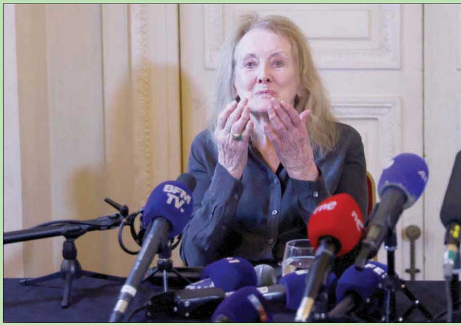
آني إرنو خلال المؤتمر الصحفي الذي عقده عقب إعلان فوزها بالجائزة

لآداب هذا العام، لم يقرأ كتاباً واحداً لها، وهي مفاجأة اعتاد عليها جمهور الأدب حول العالم، إذ دائماً ما يكون الكاتب أو الكاتبة من غير المشهورين على مستوى الجمهور الأدبي حول العالم.