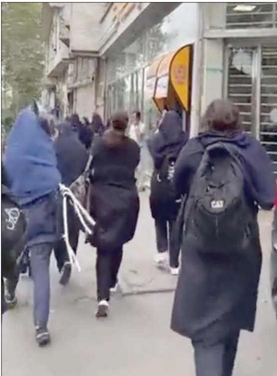
مسيرة للطالبات في رشت أمس

وقال المرجع الديني في قم، حسين نوري همداني، لدى استقباله قائد الشرطة حسين أشترى، إنه «يجب الفصل بين الأعداء مع الأشخاص الذين تأثروا بالعوطف»، ونقلت وكالة «إيرنا» الرسمية عن همداني، الذي بعد أبرز المرابع الداعين للمرشد علي خامنئي، قوله إن «الأعداء يحاولون الإضرار بالبلاد عبر تلميحات إلى وحيدى بمثابة إساءة من وسائل الإعلام المعادية للإضرار بالنظام». وفي إشارة ضمنية إلى الانتقادات الدولية الواسعة، أشاد همداني بأداء الشرطة في مواجهة المسيرات الاحتجاجية، وقال: «فتبار حقوق الإنسان الآن يستخدم كأداة بيد قوى الهيمنة لفرض مطالبهم غير المشروعة على الأمم التي تطالب بالحرية».