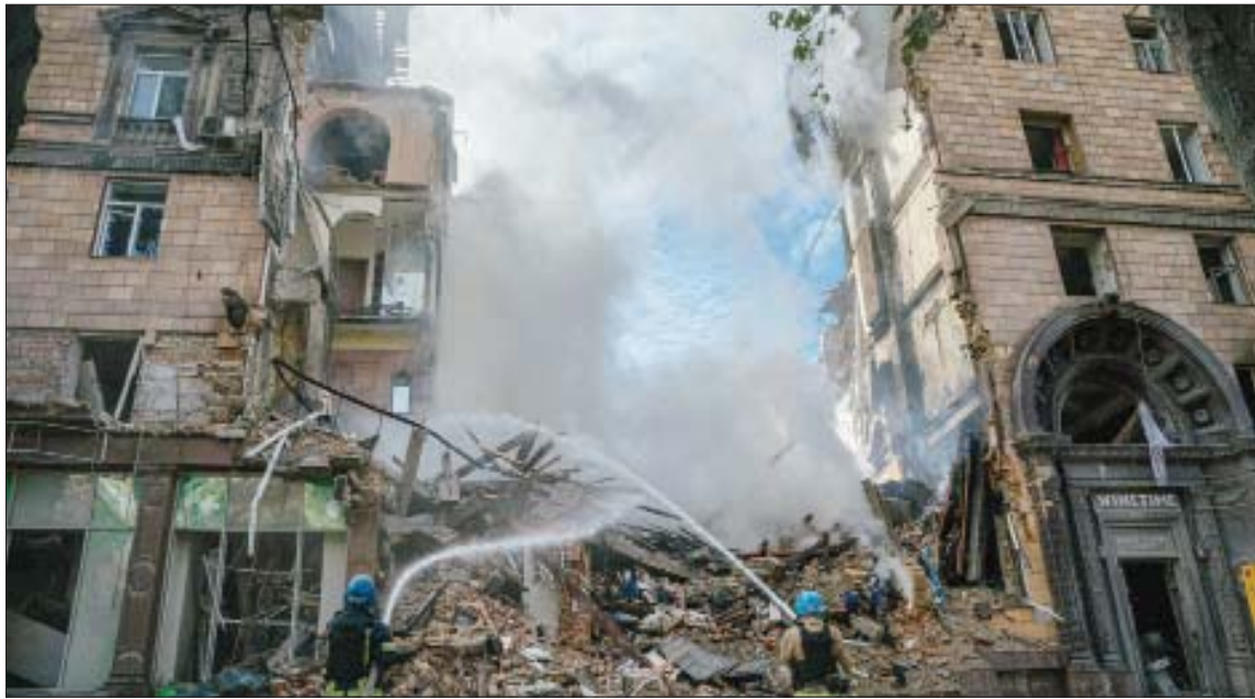
رجال الماطف يخمدون النيران بالباني التي تعرضت للقصف المدفعي في زابوريجيا أمس

كييف - موسكو، «الشرق الأوسط» استعادت القوات الأوكرانية أكثر من 400 كيلومتر مربع في جنوب منطقة خيرسون خلال أقل من أسبوع، وفق ما أعلنت الناطقة باسم القيادة العسكرية الجنوبية أمس الخميس، بعدما أعلنت موسكو ضمّ المنطقة. وقالت ناتاليا غومنيوك في بيان: «حررت القوات المسلحة الأوكرانية أكثر من 400 كيلومتر مربع من منطقة خيرسون منذ مطلع أكتوبر (تشرين الثاني) الحالي، فيما أكد الجيش الروسي أنه «تم إبعاد العدو عن خط دفاع القوات الروسية» في المنطقة نفسها. وأضاف الجيش الروسي في تقريره اليومي أن القوات الأوكرانية نشرت 4 كتائب تكتيكية على هذه الجبهة؛ أي مئات الرجال، وحاولت مرة عدة اختراق الدفاعات الروسية» قرب دودنشاني وسوخانوفي وسادوك وبروسكينسكي. وأعلن الرئيس الأوكراني فولوديمير زيلينسكي، الأربعاء، أن قواته استعادت 3 قرى في منطقة خيرسون الجنوبية من القوات الروسية. وأضاف في مقطع فيديو نُشر على مواقع التواصل الاجتماعي: «تم تحرير نوفيوفوسكريفسكي وسوقوغريغوريفسكا