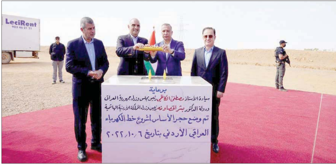
الكازمي والخصاونة خلال حفل وضع حجر الأساس لمشروع خط الربط الكهربائي

ولفت رئيس الوزراء الأردني إلى أن «المشروع يؤسس لمشاريع وستنطلق قريباً»، مؤكداً أن من شأن هذا المشروع أن يعزّز أمن البلدين ويحافظ على اعتماديّة النظام الكهربائي في الأردن والعراق، وأشار إلى الحرص الذي يبديه رئيس الوزراء العراقي على الأمن والاستقرار والرفاهية للعراق وأن تكون علاقات العراق متوازنة ومنظمة وفعّية مع إقليمه ومع جواره العربي وتحديداً مع الأردن، معرباً عن الأمل بالاطلاق الفعلي لهذا المشروع الحيوي الصيف المقبل.