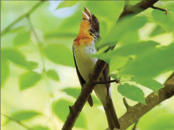
الطائر الهجين النادر

غير محتمل بين أنثى طائر «غروسبيك الوردي»، وذكر «التناجر القرمزي»، ولكن كيفية لقائهما ومكانه، لا يزالان لغزاً للباحثين، إذ يفضل النوعان موائل مختلفة، فيفضل «التناجر القرمزي» عادة غطاء الغظلة للغابات الناضجة، بينما يكون «غروسبيك الوردي» سعيداً في العراء على طول حواف الغابات. وأوضح القرمزي أن