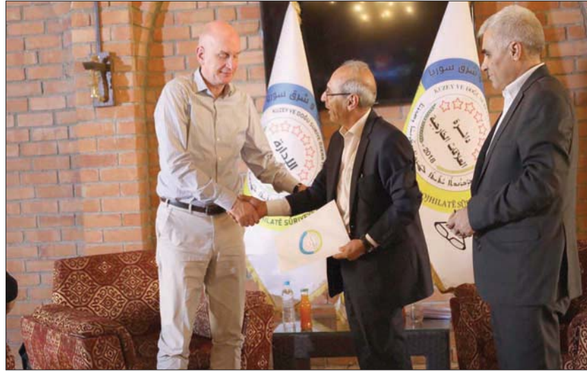
مدير الشؤون القانونية والاقتصادية في الخارجية الألمانية مع مسؤولي الإدارة الذاتية في القامشلي (موقع الإدارة)