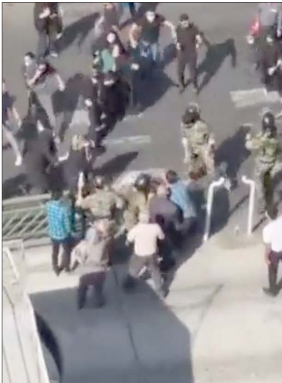
مناوشات بالأيدي بين الشرطة والنساء في شارع بطهران

وتشارك في جانب هذه القوات وحدة «نخسا» ذراع «فيلق القدس» المكلف بالعمليات الخارجية التابعة لـ«الحرس الثوري»، وتعد «نخسا» مسؤولة عن تدريب وتجنيد ميليشيات إقليمية تحارب تحت لواء «فيلق القدس»، مثل ميليشيا