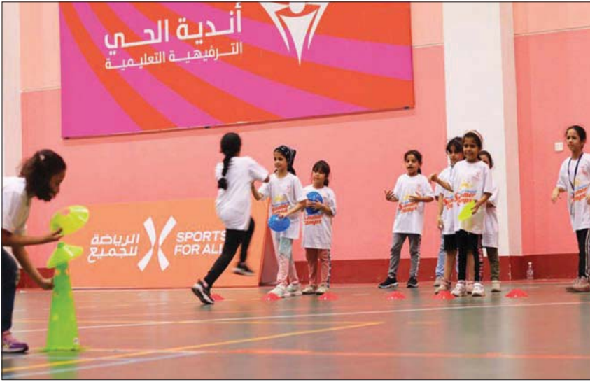
الفتيات الصغار حظين بفرصة المشاركة في أنشطة الاتحاد الصيفية (الشرق الأوسط)

كل من الرياض وحدة والمنطقة الشرقية، لمدة 16 أسبوعاً لتعريف رياضة التنس للجيل الجديد من المشجعين في جميع أنحاء المملكة، وتمكينهم من ممارسة الرياضة والحفاظ على صحتهم. كما أطلق اتحاد برنامجاً نشاطياً في آخر شهر أغسطس (آب) الذي أقيم في عدة مدن حول المملكة. ويسعى الاتحاد السعودي للرياضة للجميع لتطوير الرياضات المجتمعية، ورفع مستويات النشاط البدني في المملكة إلى 40 في المائة بحلول العام 2030، لكي يساهم في خلق مستقبل أكثر إشراقاً وصحة لأفراد المجتمع بالمملكة. ويتطلع لمساعدة المزيد من الأفراد على الاستمتاع بنشاط مثرية، مع دعمهم للحفاظ على لياقتهم ونشاطهم، ويعد هذا جزءاً مهماً من جهود الاتحاد السعودي للرياضة للجميع للمساعدة في تحقيق أهداف برنامج «جودة الحياة»، أحد مستهدفات «رؤية 2030». وفي الوقت الراهن يمارس ما يقارب 48,2 في المائة من سكان المملكة في الأنشطة البدنية والرياضية لمدة 30 دقيقة على الأقل في الأسبوع بحسب دراسات هيئة الإحصاء.