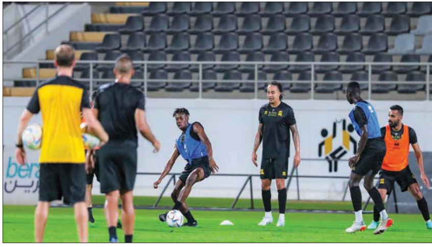
من استعدادات الاتحاد الأخيرة

في الوقت الذي تعاقد النادي مع اللاعب في يناير (كانون الثاني) الماضي بعد دخوله الفترة الحرة، مع نادي الشباب إلا أنه انضم بشكل رسمي للفريق خلال فترة الانتقالات الصيفية مؤخرًا. وشهدت عملية بيع تذاكر المواجهة التي ستجمع الاتحاد والخليج إقبالاً جماهيرياً محدوداً حيث لم تتجاوز عدد التذاكر المباعة حاجز 7 آلاف تذكرة، فيما حددت أسعار التذاكر الموحدة بـ30 ريالاً والفضية بـ200 ريال والذهبية بـ400 ريال. ويتطلع الاتحاد للفوز في المواجهة التي ستجمعه على أرضه وبين جماهيره أمام الخليج لمواصلة المحافظة على جادة الانتصارات التي عادت لفريق الخليج في الجولة الماضية أمام الرائد بهدف نظيف. ويحتل فريق اتحاد المركز الثالث في سلم ترتيب فرق الدوري برصيد 7 نقاط، ويأتي الخليج الرابع عشر برصيد نقطة واحدة. إلى ذلك، صدم المغربي حمد