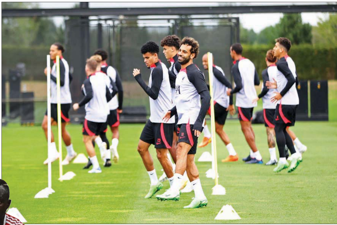
لاعب ليغربول مطالبون بانتفاضة أمام أياكس لتعويض البداية المخيبة بدوري الأبطال (رويترز)

31 هدفاً في 9 مباريات في مختلف المسابقات، فقد بدأ كبيرة لتعويض مكان النجم غياب التوغلات في اللحظات الحاسمة لهدافه السابق ليفاندوفسكي، المنتقل إلى برشلونة الذي سيكون عليه خوض مواجهة عاطفية ضد فريقه السابق الذي دافع عن لوانه منذ 2014، وتوج معه هدافاً للدوري الألماني 6 مرات في المواسم السبعة الماضية. في بداياته في إسبانيا؛ حيث سجل 6 أهداف في 5 مباريات في «الليغا» ليحتل مكانه المعتاد على قمة لأخعة الهادفين. وسيكون السنغالي ساديو ماني أمام فرصة مثالية لتأكيد أنه خير خلف ليفاندوفسكي في هجوم البايرن؛