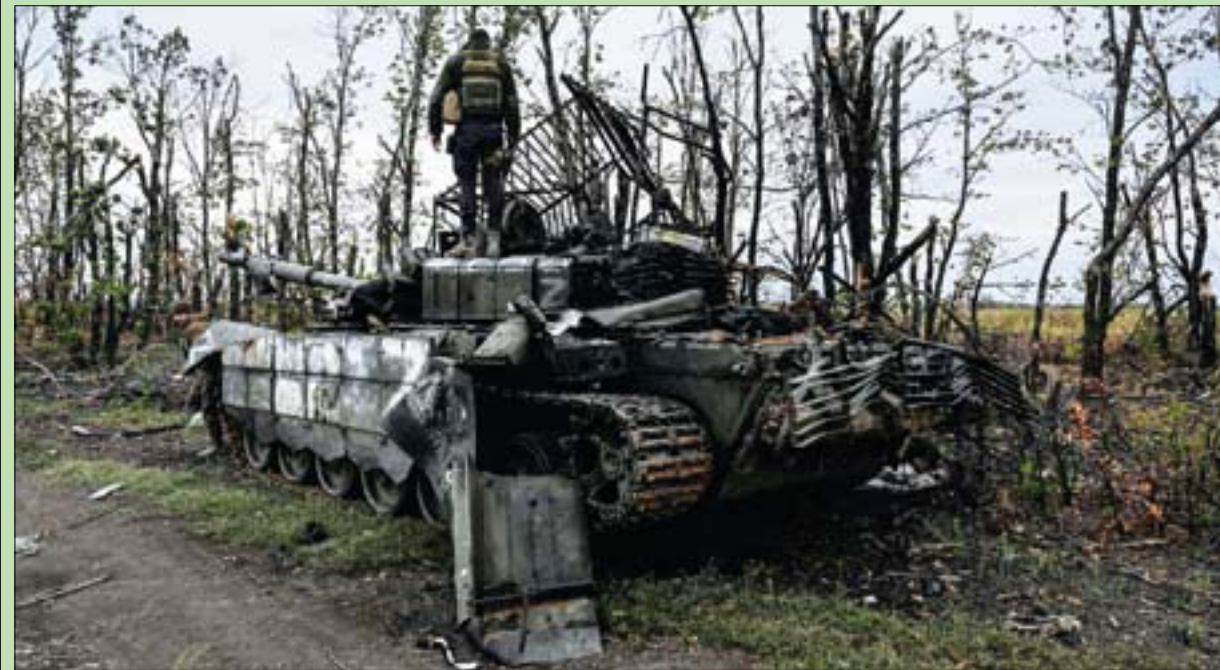
جندي أوكراني يقف على دبابة معطلة تركها الروس في ضواحي خاركيف

وفي جنيف، دانت الأمم المتحدة ما تمارسه روسيا من «ترهيب وإجراءات قمع وعقوبات» في حق الأشخاص الذين يعترضون عن معارضتهم للحرب في أوكرانيا، مما يقوّض ممارسة الحريات الأساسية المضمونة في الدستور؛ لا سيما الحق في حرية التجمع والتعبير وتكوين الجمعيات». (تفاصيل ص 11)