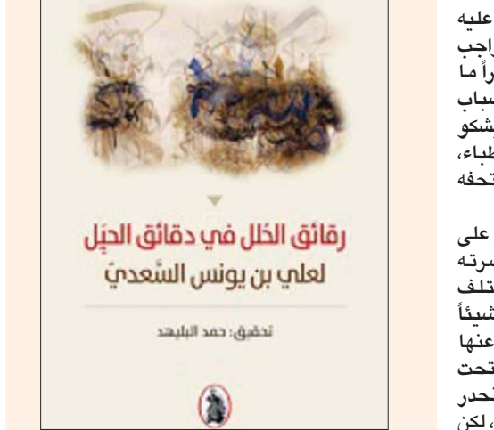
عمان، الشرق الأوسط، نطق، حمد البليهد

يرصد كتاب «شوقي الآخر» الصادر عن الهيئة المصرية العامة للكتاب للشاعر أحمد عنتر مصطفى جوانب من الحياة الشخصية لأمير الشعراء أحمد شوقي، ويبرد عن كثيراً من الاتهامات والشائعات التي طاردهت حياً وميتاً. ومنها ما يتعلق برفاهية شوقي، مؤكداً أنه لم يكن أميراً، ولم يكن من مواليد القصور، ولم يعرف فمه ملاحق الذهب في صباه كما يحلو للبعض أن يرضى، أو كما هو شائع فيما تذكره بعض الكتابات كحقيقة مسلم بها. تم البناء عليها حتى صارت الصورة ورتوشها أقوى من الطلوع الأصلية التي تكونها: وبحسب الكتاب، فإن شوقي هو حفيد نضابط من أصل كردي جاء في حملة «محمد علي» قبل أن يصبح والياً على مصر 1805. أما والده فقد كان ميسور الحال، ورث عن أبيه ثروة أثلّفها، ما جعل والدته لامة تكفله لتضمن له حياة غير متقلبة، وكانت هذه الجدة التركية، واسمها «تمران» مجرد إحدى وصيفات القصر في عهد الخديوي إسماعيل. مضيفاً أن الكل يكاد يعرف الواقعة الشهيرة حين قادته المصادفة طفلاً في صحبه جدته إلى لقاء حاكم البلاد وعمره 3 سنوات. قالت الجدة لواللي: «إنه لا يمكن أن ينظر إلى الأرض، فأخرج الخديوي من جيبة قطعة ذهبية والقي بها على سجادة، فخطف بريقها عين الصغير فنظر إلى السجادة وما فوقها، ففقهه الخديوي، وقال لها: عاجلجيه بهذا الدواء، سوف يتمائل للشفاء». عاش «شوقي» ودرج في حي «الحسني» وانتظم في مدارس هذا الحي الشعبي، دخل كتّاب «الشيخ صالح»، وهو في الرابعة، ومنه انتقل إلى مدرسة المبتديان، فالتجيزية، فأمين القصور إن؟ يتساءل المؤلف، مؤكداً أنها سنوات التكوين الأولى، ولها تأثير هائل في وجدان المرء عامة، والمبدع في