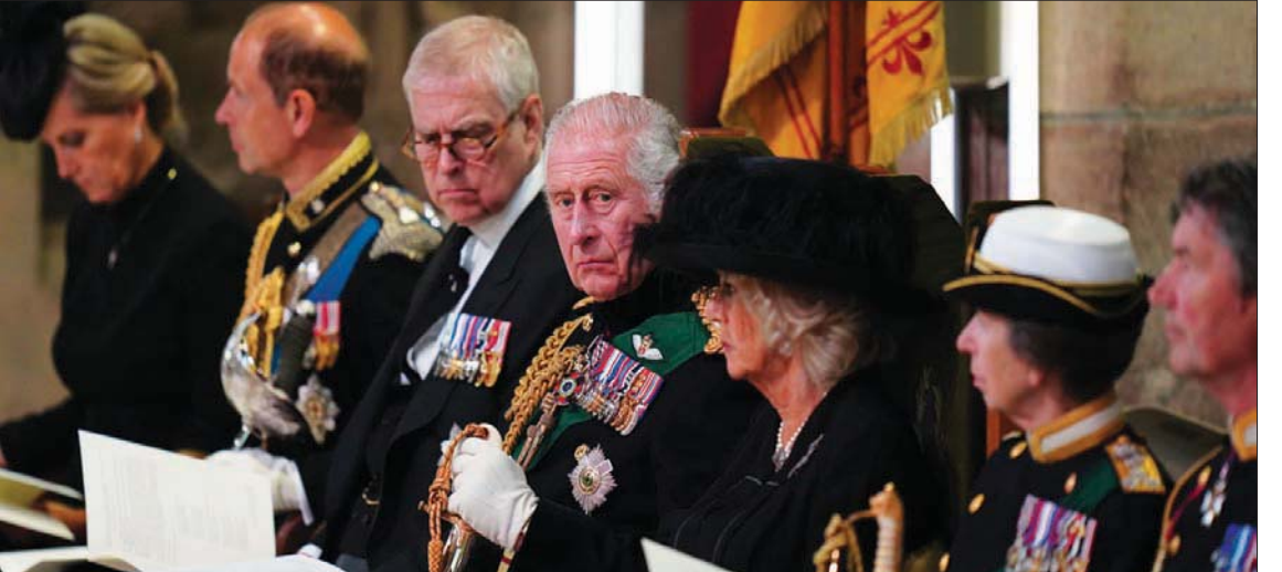
(من اليسار) الكونتيسة صوفي، الأمير إدوارد، الأمير أندرو، الملك تشارلز وزوجته كاميليا، الأميرة آن وزوجها تم لورانس خلال مراسم تأبين الملكة إليزابيث في كنيسة «سانت جايلز» في أدنبرة أمس (أ.أ.)