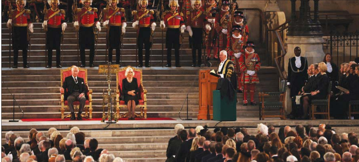
الملك تشارلز وزوجته كاميليا في قلعة وستمنستر خلال اجتماع مجلسي العموم واللوردات أمس

في بريطانيا منذ عام 1688، عندما دعا البرلمان فيليب، أمير أورنج، ليحل محل الملك جيمس. ووصفه بأنه «وسيلة الحياة والتنافس لديمقراطيتنا». وتابع: «وانا أقت أمائمك اليوم، لا يسعني إلا أن أشعر بثقل التاريخ الذي يحيط بنا، الذي يذكرنا بالتقاليد