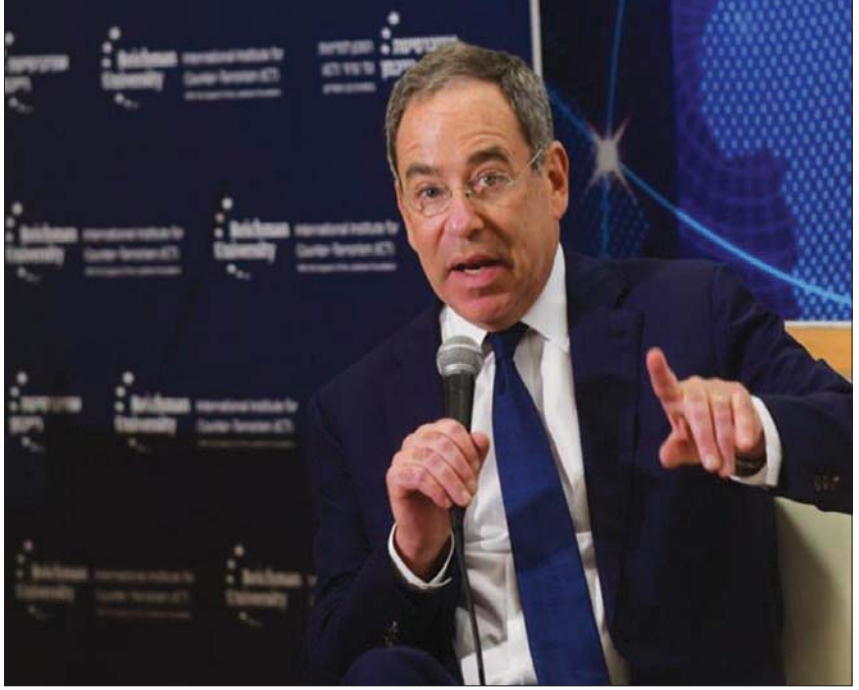
السفير الأميركي توماس نيديس متحدثاً في مؤتمر رايمخان

أعلن السفير الأميركي لدى إسرائيل، توماس نيديس، أنه «لا يمكن أن يستمر الوضع في الضفة الغربية أكثر من ذلك»، ودعا الحكومة الإسرائيلية إلى تغيير هذا الوضع على الأرض. وكان رئيس جهاز الأمن العام (الشاباك)، رونين بار، قد حذر من ازدياد عمليات إطلاق النار في الضفة الغربية، لكنه عزا ذلك إلى «أداء أجهزة الأمن الفلسطينية، التي - حسب وصفه - فقدت سيطرتها الميدانية»، لافتاً إلى «أننا دخلنا إلى ما يشبه حلقة مغلقة وجنودنا وعناصرنا يسعون لتنفيذ الاعتقالات كل ليلة، ويتعرضون لإطلاق نار. والثمن يتمثل أيضاً بفلسطينيين مستهدفين وبتراجع في مكانة الأجهزة الفلسطينية».