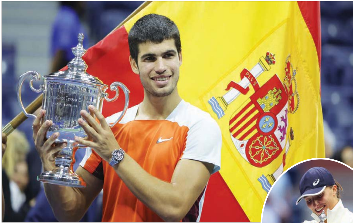
الكاراس خليفة نادال المنتظر يحتفل بكأس بطولة فلاشينغ ميدوز

العمر 24 عاماً، والذي أصبح أول لاعب أميركي أسود يبلغ الدور قبل النهائي البطولة منذ فعلها آرثر أش في 1972.